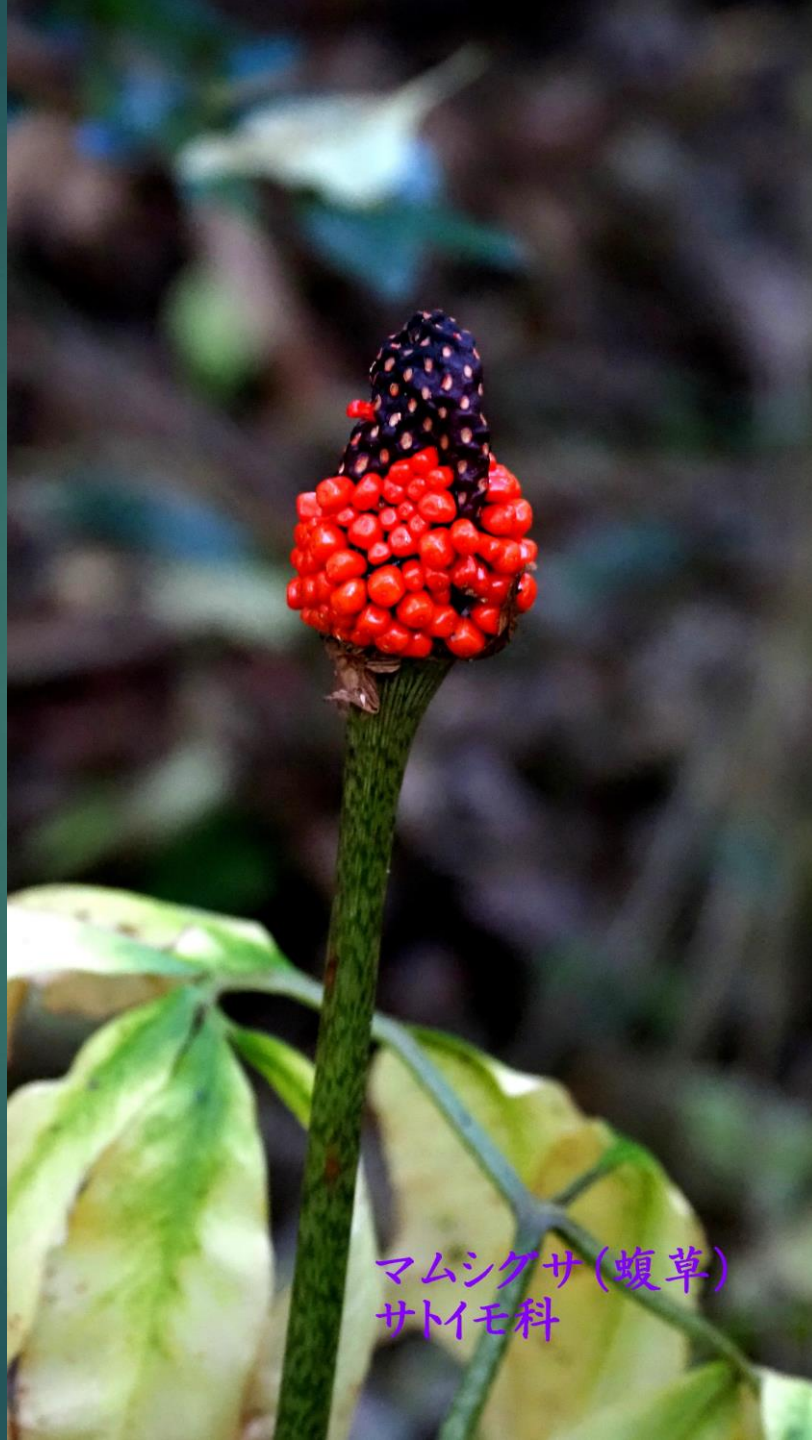
マムシグサ(蝮草) サトイモ科