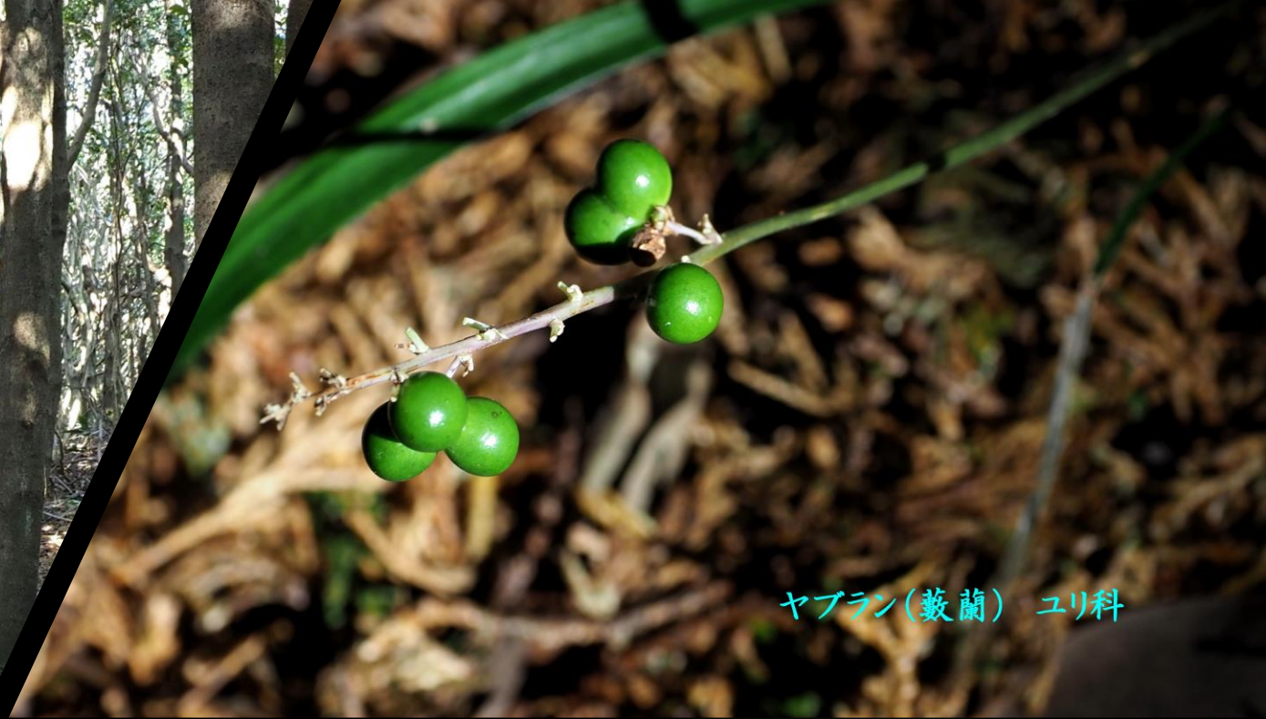
ヤブラン(藪蘭) ユリ科