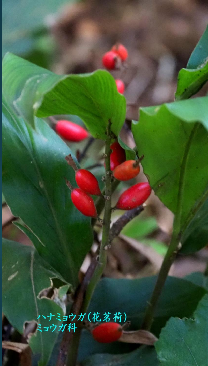
ハナミョウガ(花茗荷) ミョウガ科