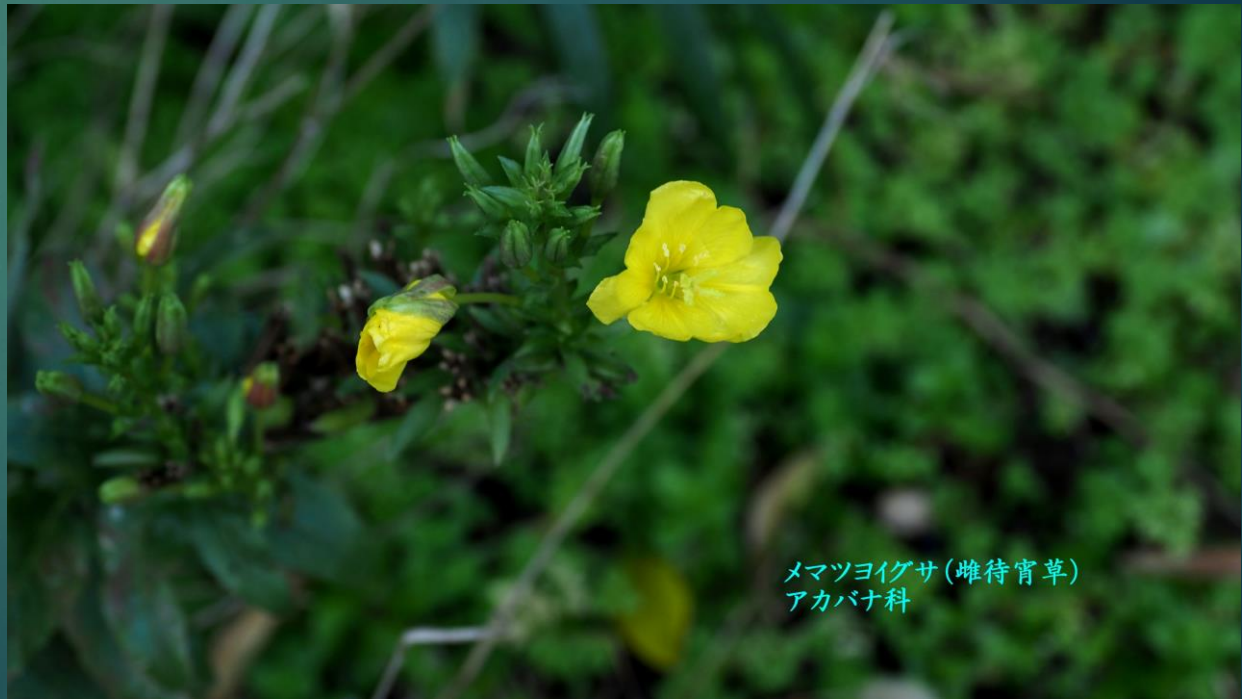
メマツヨイグサ(雌待宵草) アカバナ科