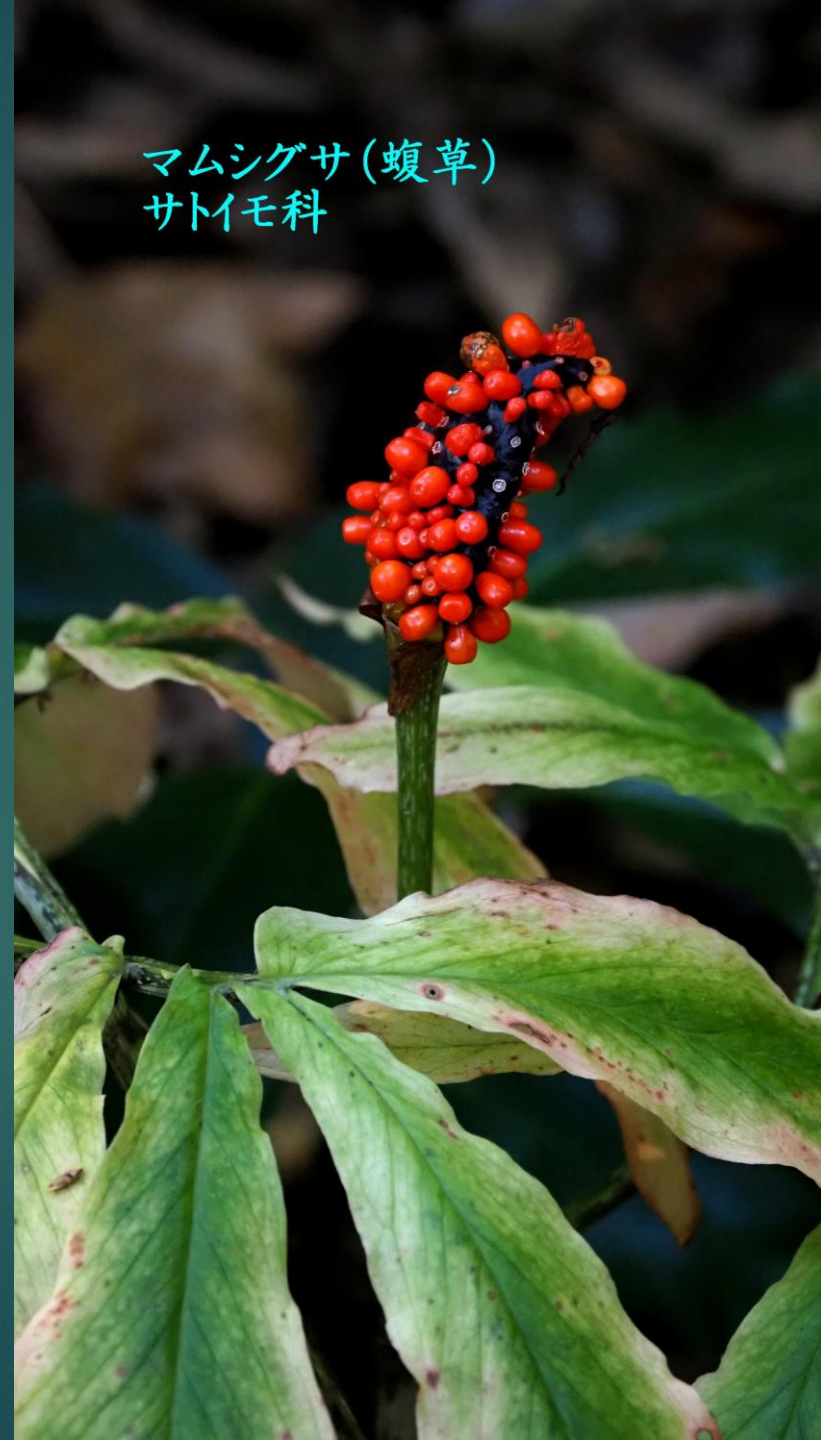
マムシグサ(蝮草) サトイモ科