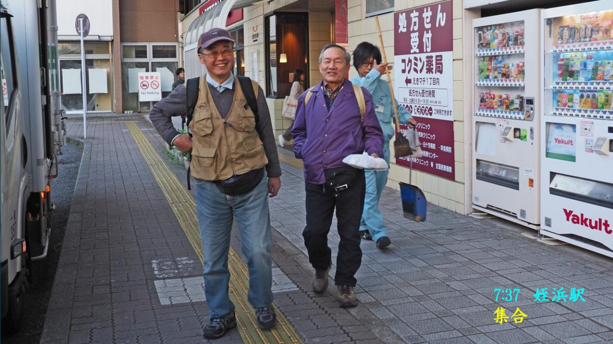
7:37 姪浜駅 集合