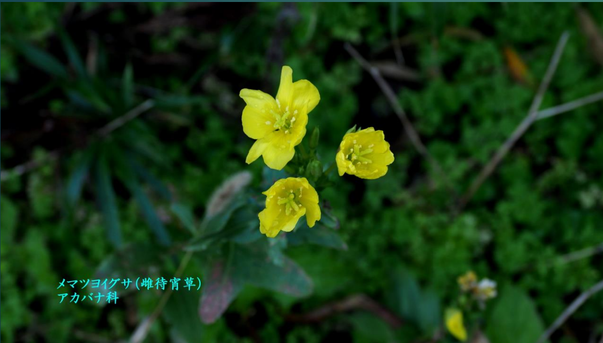
メマツヨイグサ(雌待宵草) アカバナ科