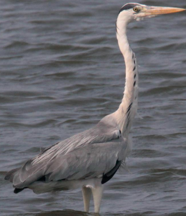
アオサギ (蒼鷺) サギ科 L=93cm