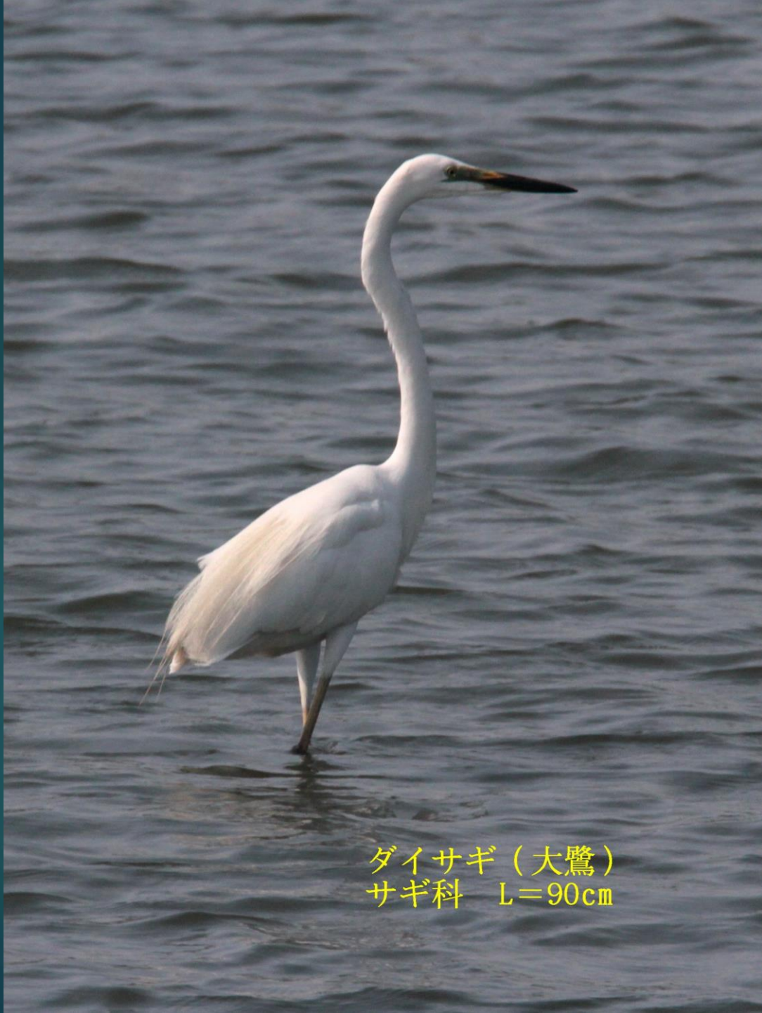
ダイサギ (大鷺) サギ科 L=90cm