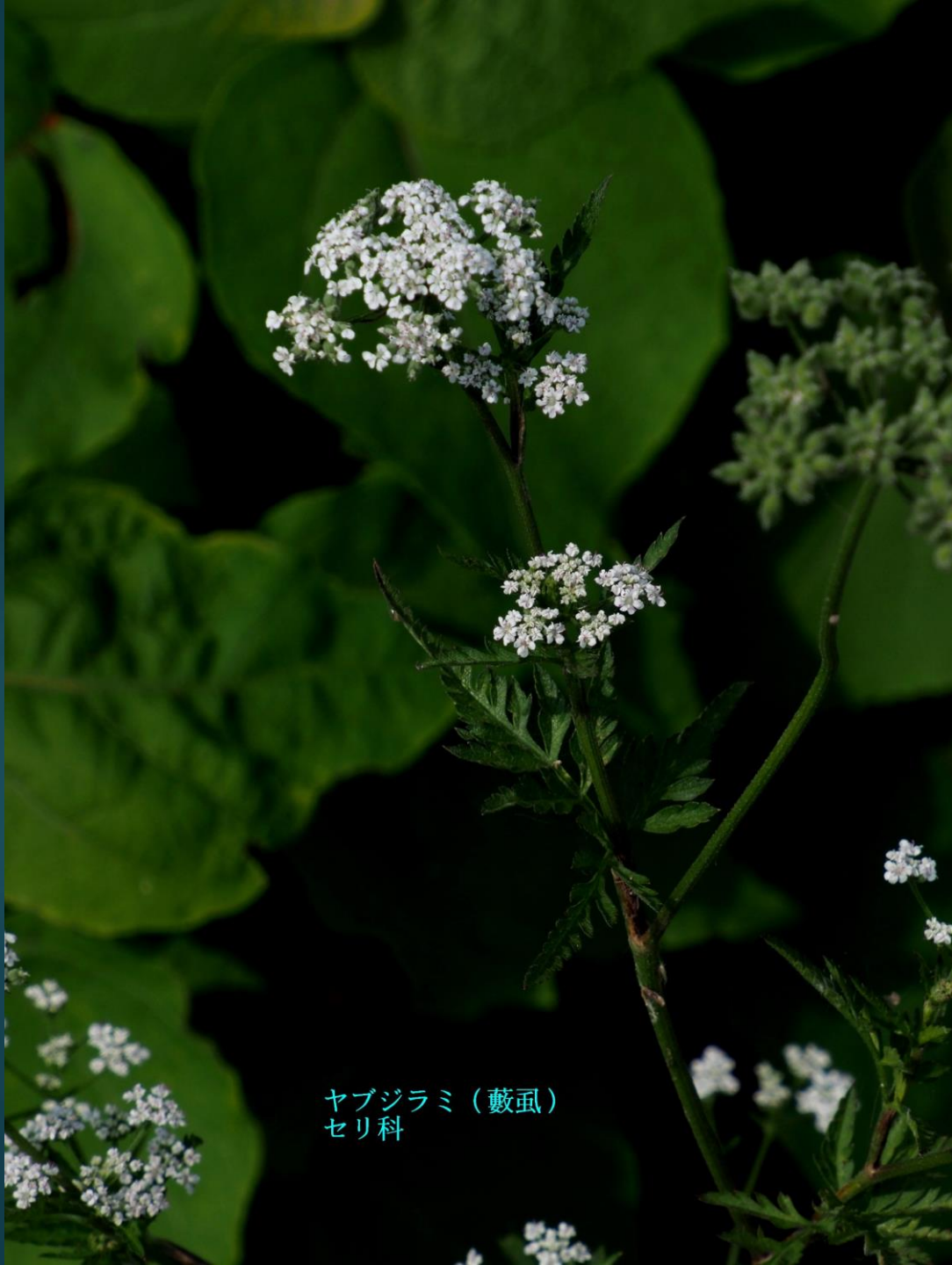
ヤブジラミ (藪虱) セリ科