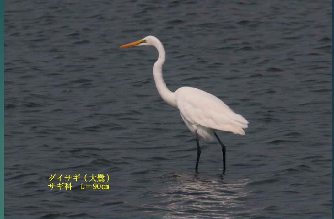
ダイサギ (大鷺) サギ科 L=90cm