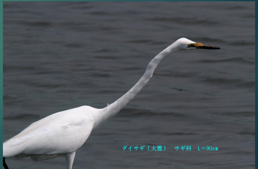
ダイサギ (大鷺) サギ科 L=90cm