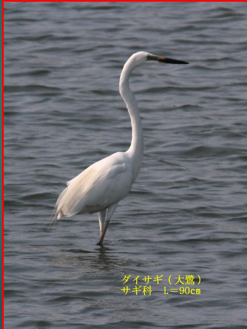
ダイサギ（大鷺） サギ科 L=90cm