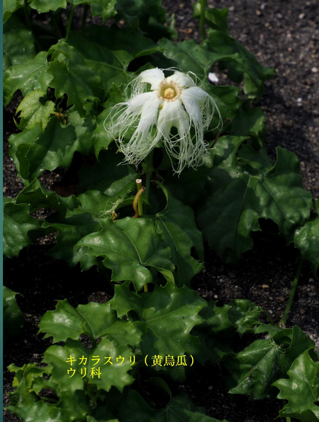
キカラスウリ (黄烏瓜) ウリ科