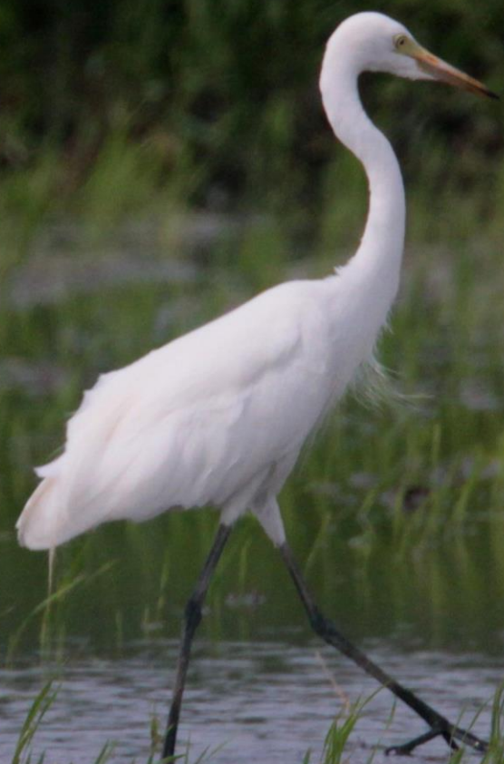
チュウサギ（中鷺） サギ科 L=68cm