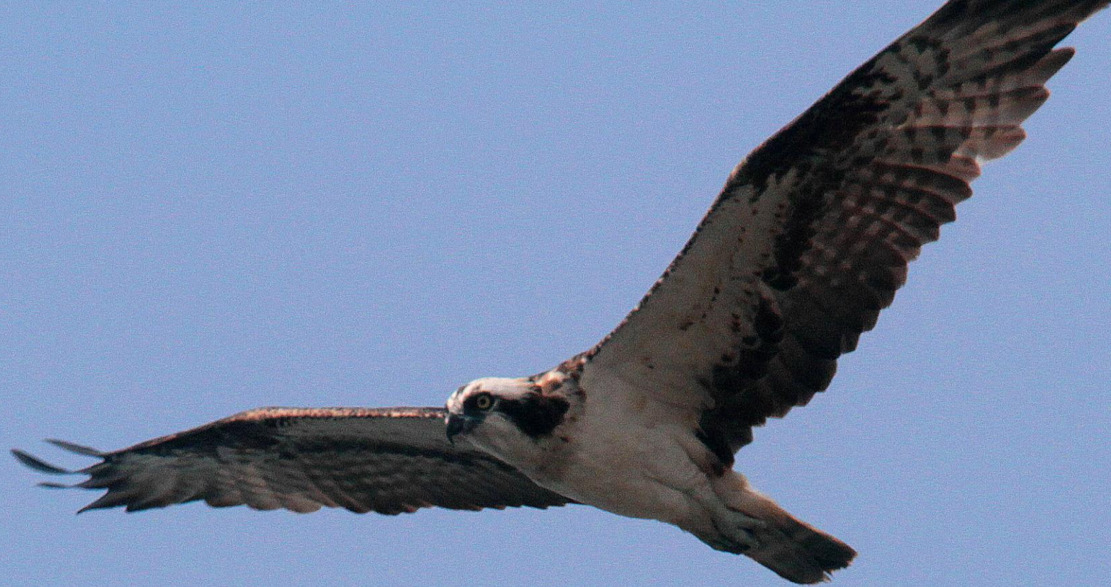
ミサゴ（鵟） ワシタカ科 L=オス54cm