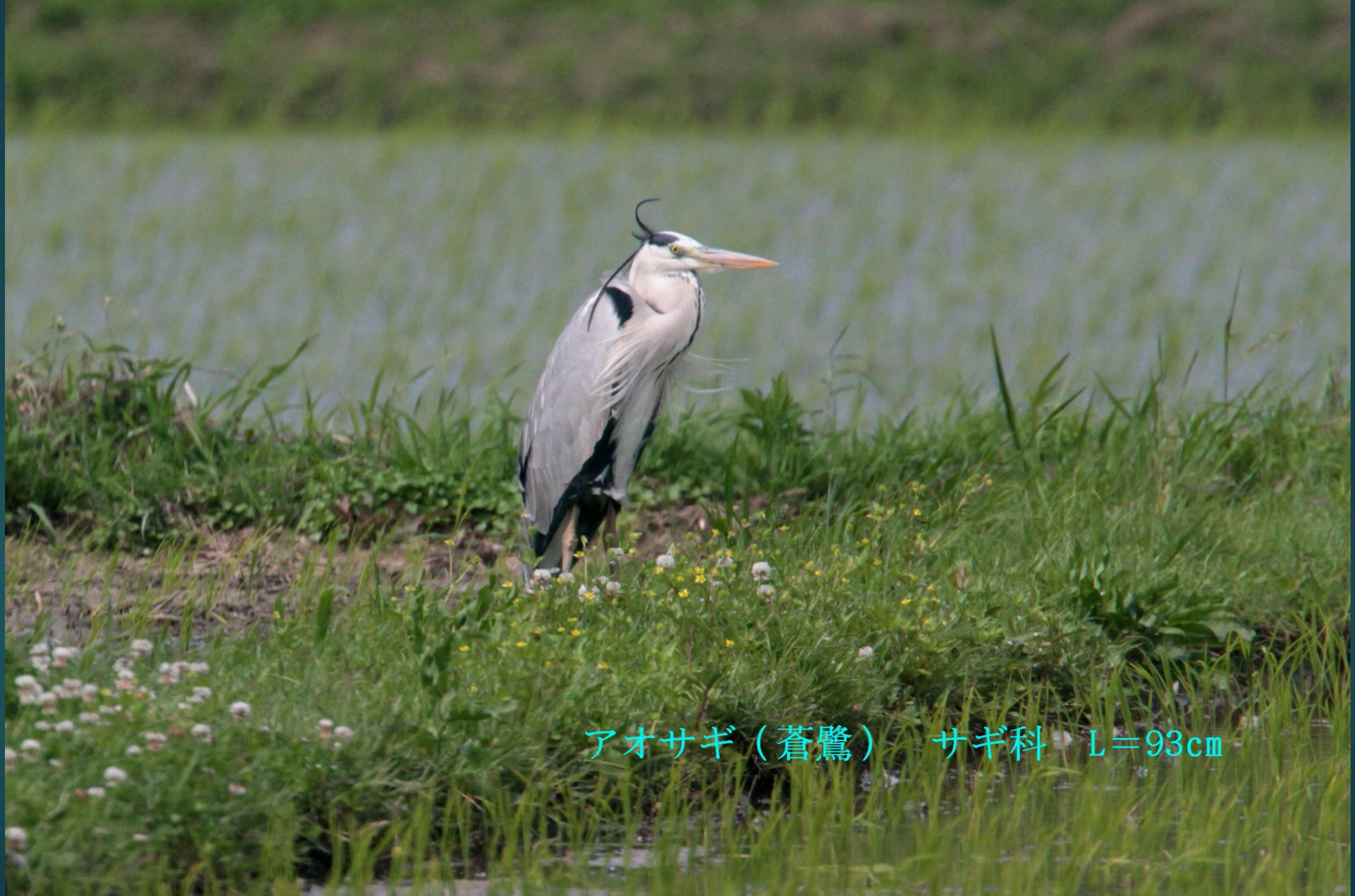
アオサギ（蒼鷺） サギ科 L=93cm