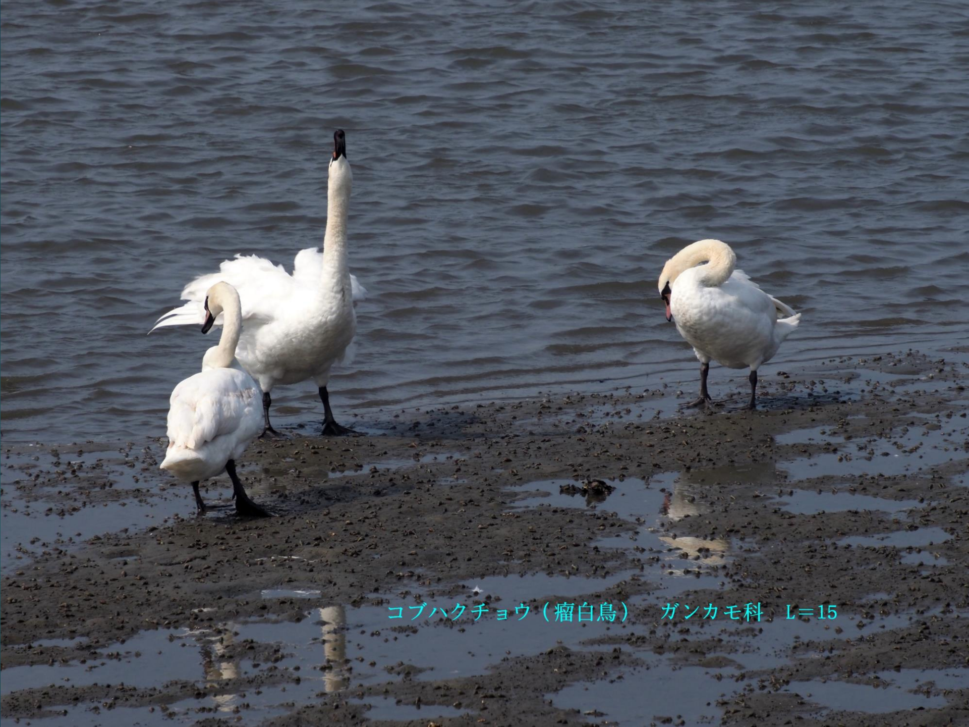
コブハクチョウ（瘤白鳥） ガンカモ科 L=15