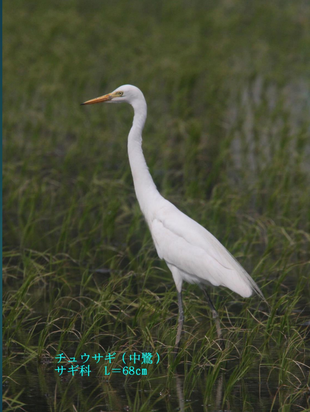
チュウサギ (中鷺) サギ科 L=68cm