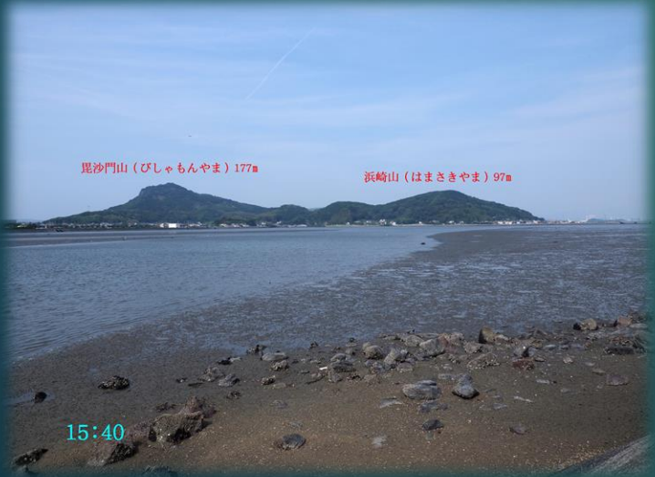
毘沙門山（びしゃもんやま）177m