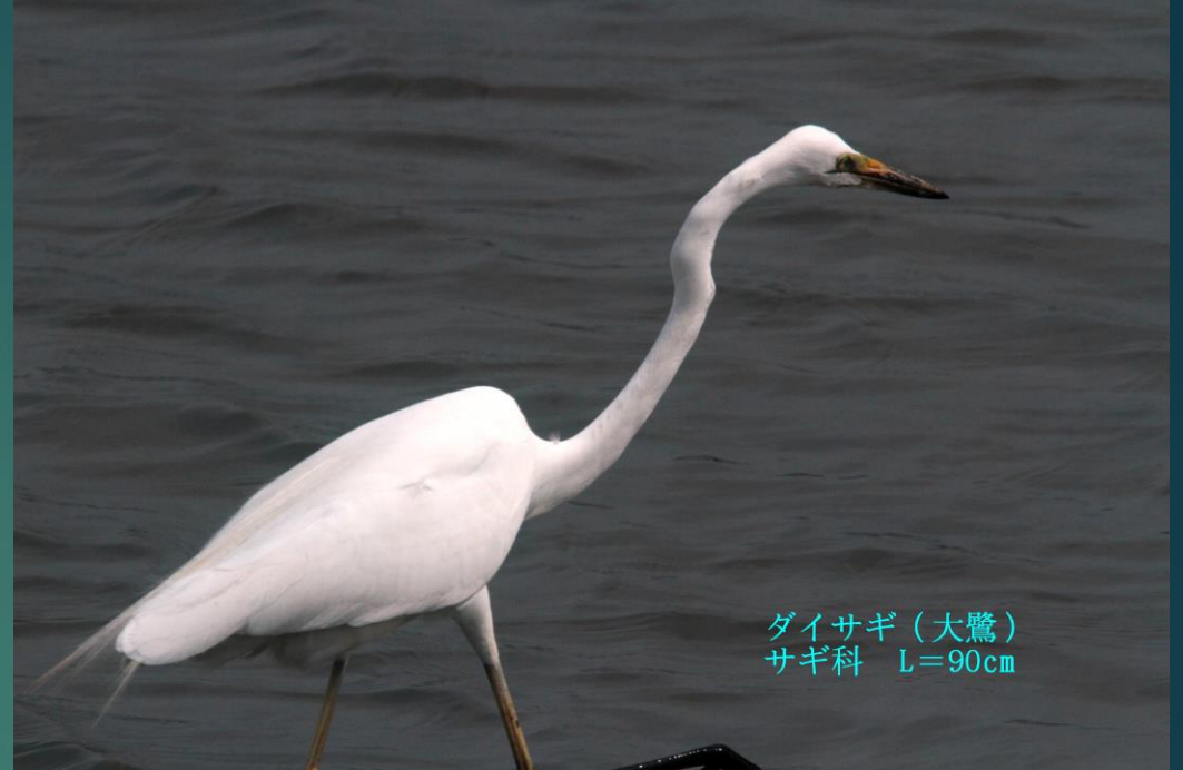
ダイサギ (大鷺) サギ科 L=90cm