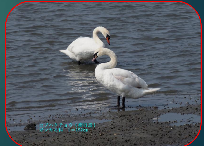
コブハクチョウ（瘤白鳥） ガンカモ科 L=152cm