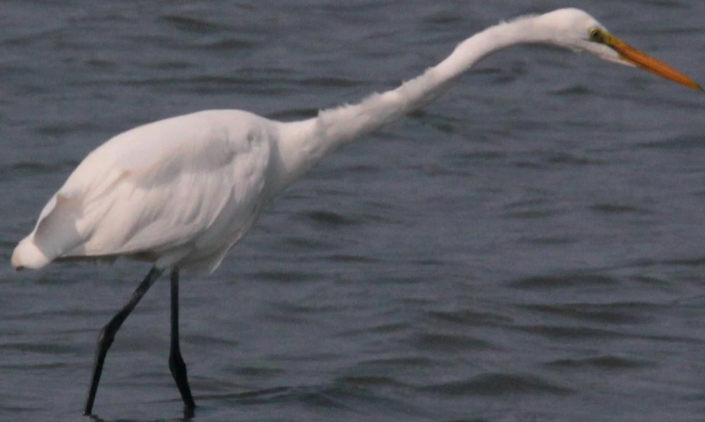
ダイサギ（大鷺） サギ科 L=90cm