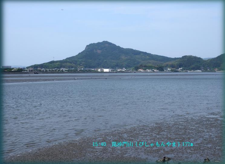
15:40 毘沙門山（びしゃもんやま）177m