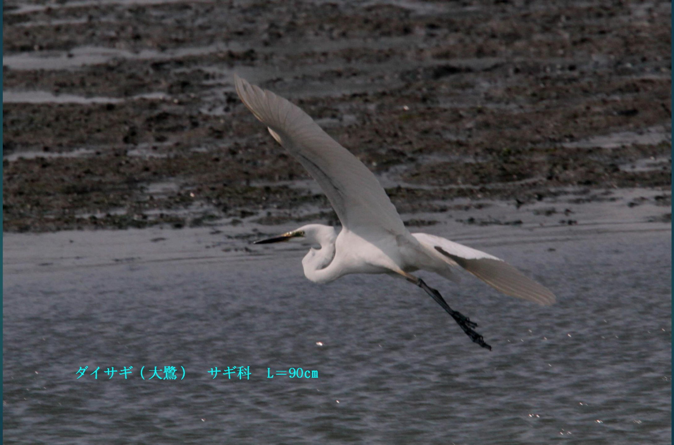
ダイサギ（大鷺） サギ科 L=90cm