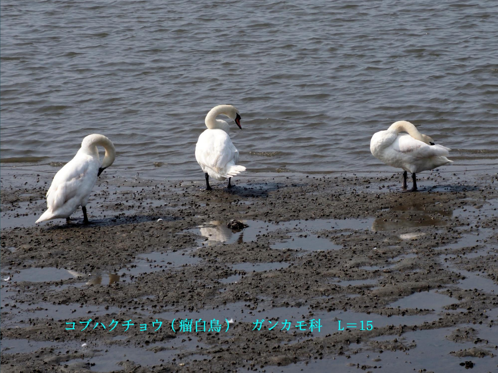
コブハクチョウ（瘤白鳥） ガンカモ科 L=15