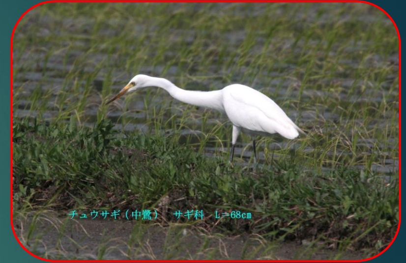
チュウサギ（中鷺） サギ科 L=68cm