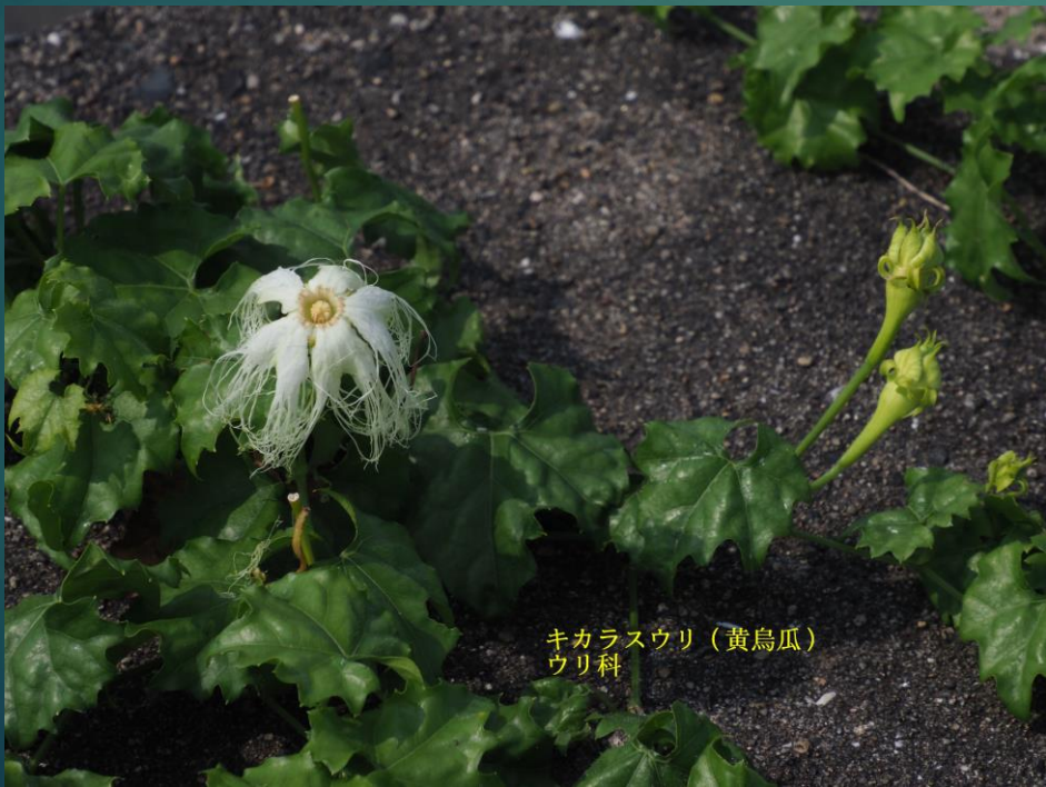
キカラスウリ (黄烏瓜) ウリ科