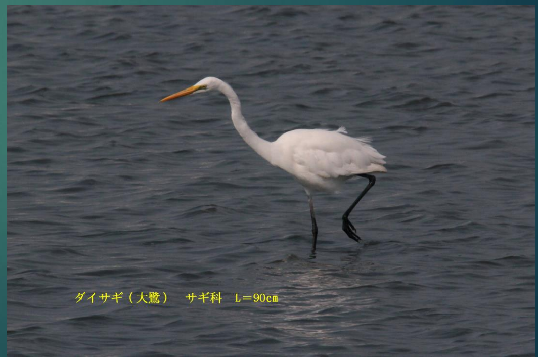
ダイサギ (大鷺) サギ科 L=90cm