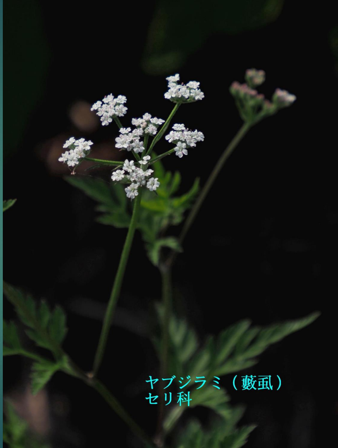
ヤブジラミ (藪虱) セリ科