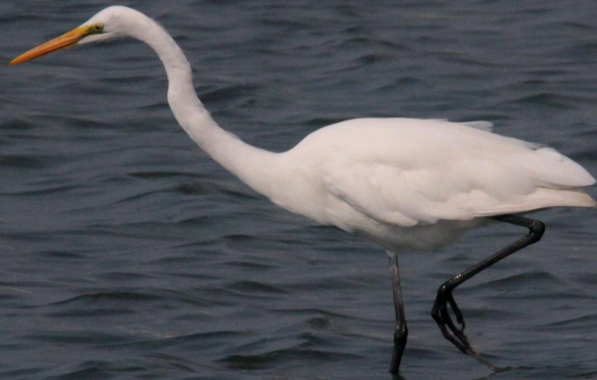
ダイサギ（大鷺） サギ科 L=90cm