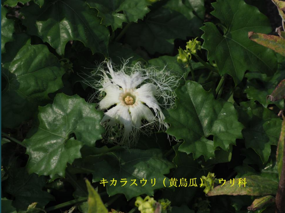
キカラスウリ (黄烏瓜) ウリ科