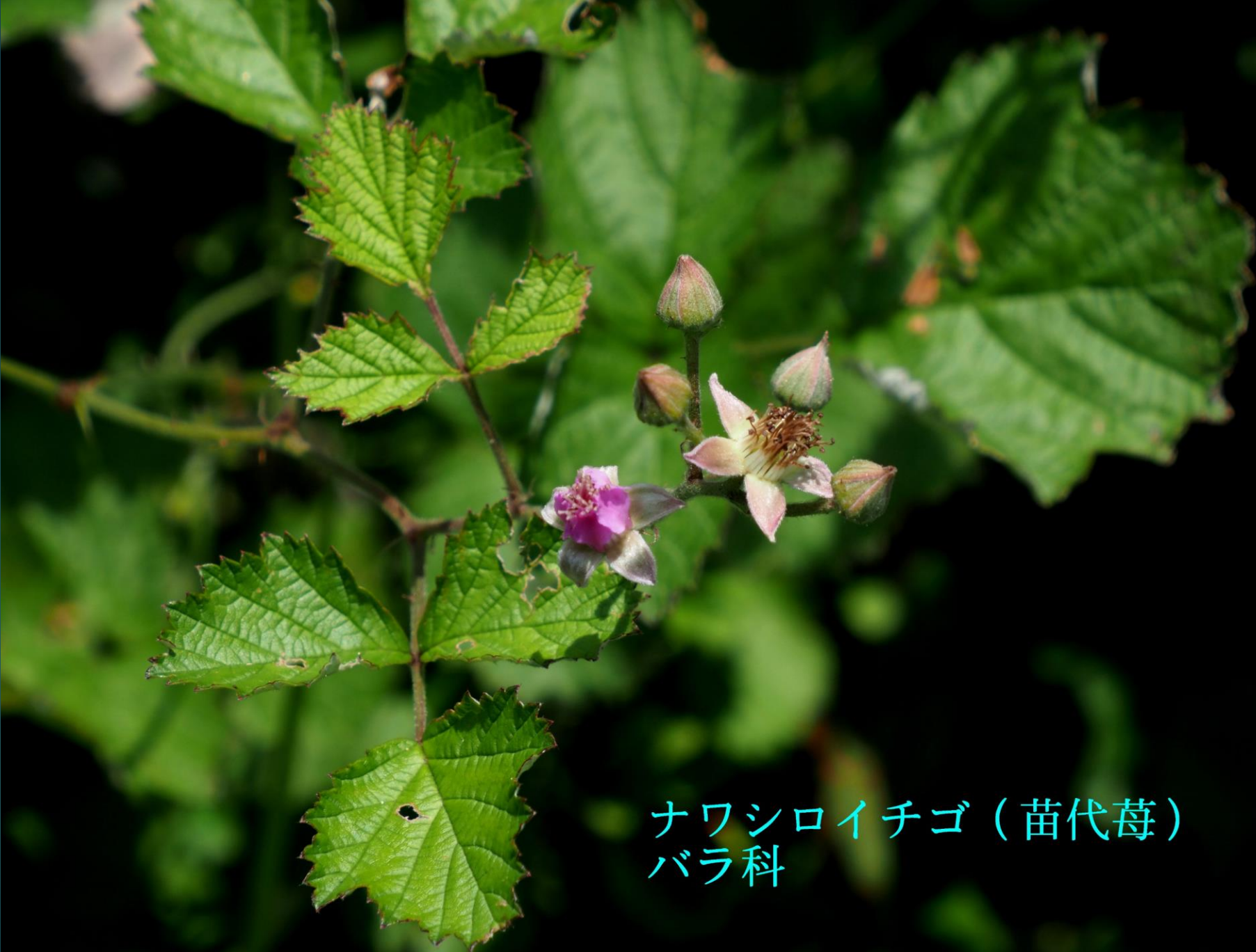
ナワシロイチゴ（苗代苺） バラ科