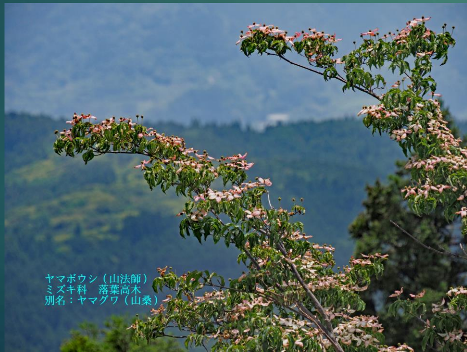
ヤマボウシ（山法師） ミズキ科 落葉高木 別名：ヤマグワ（山桑）