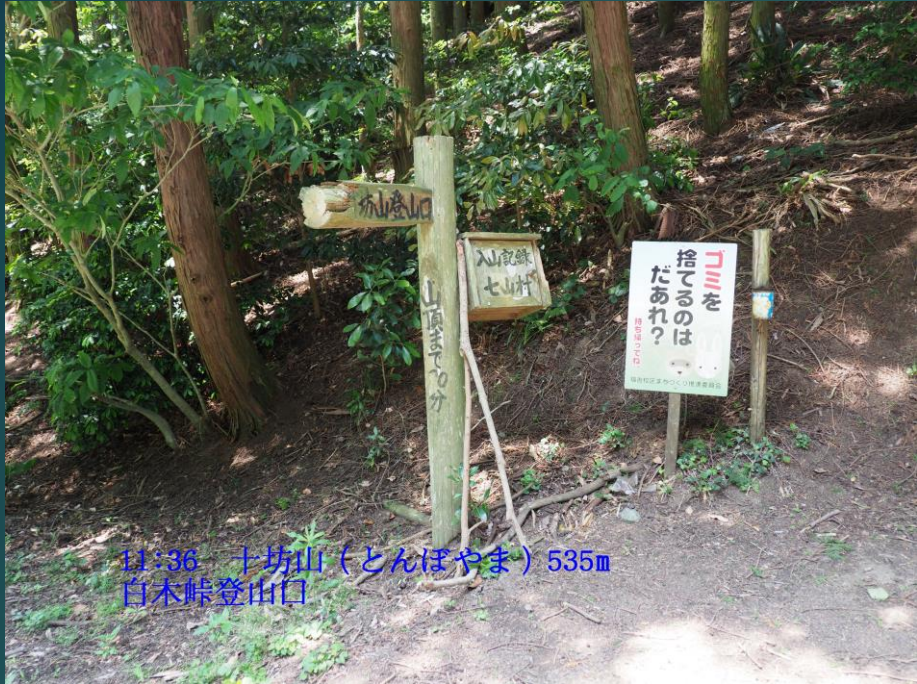
11:36 十坊山(とんぼやま) 535m 白木峠登山口