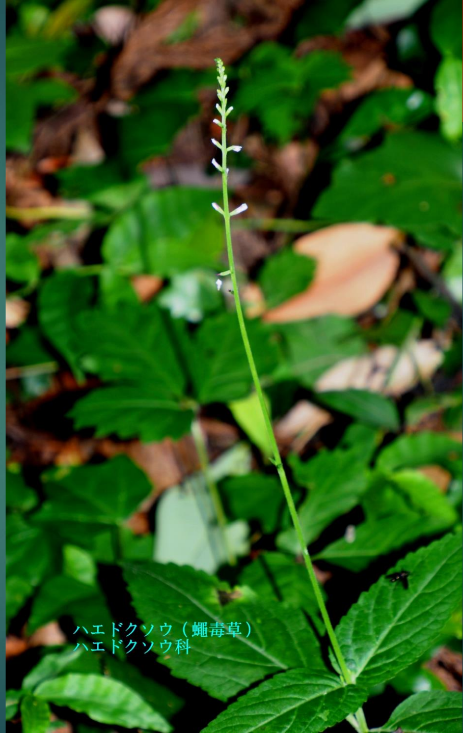
ハエドクソウ ( 蠅毒草 ) ハエドクソウ科