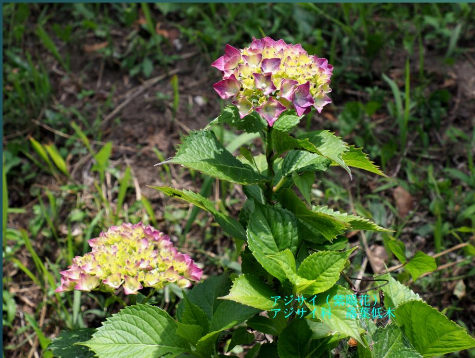
アジサイ (紫陽花) アジサイ科 落葉低木