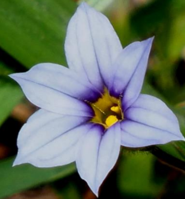
ニワゼキショウ（庭石菖） アヤメ科 帰化植物