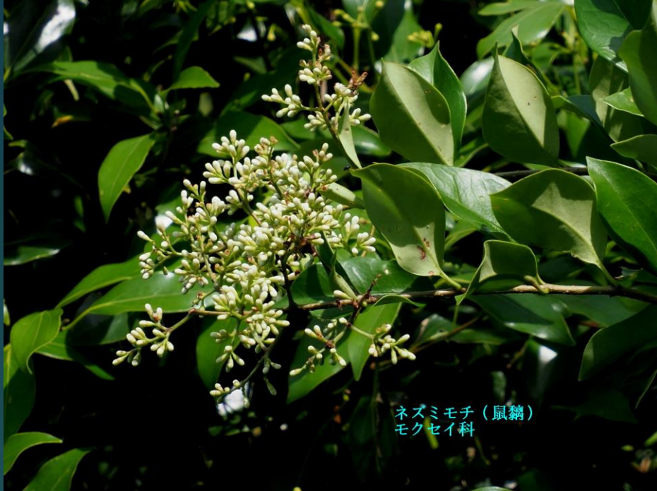
ネズミモチ (鼠竊) モクセイ科