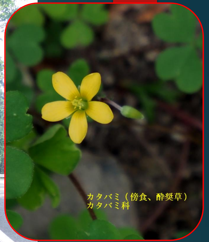
カタバミ (傍食、酔罌草) カタバミ科