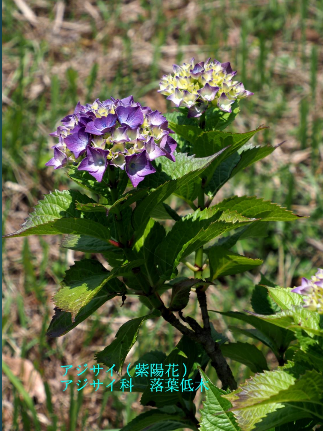
アジサイ (紫陽花) アジサイ科 落葉低木