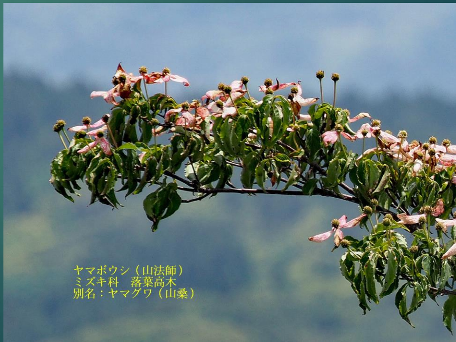
ヤマボウシ（山法師） ミズキ科 落葉高木 別名：ヤマグワ（山桑）