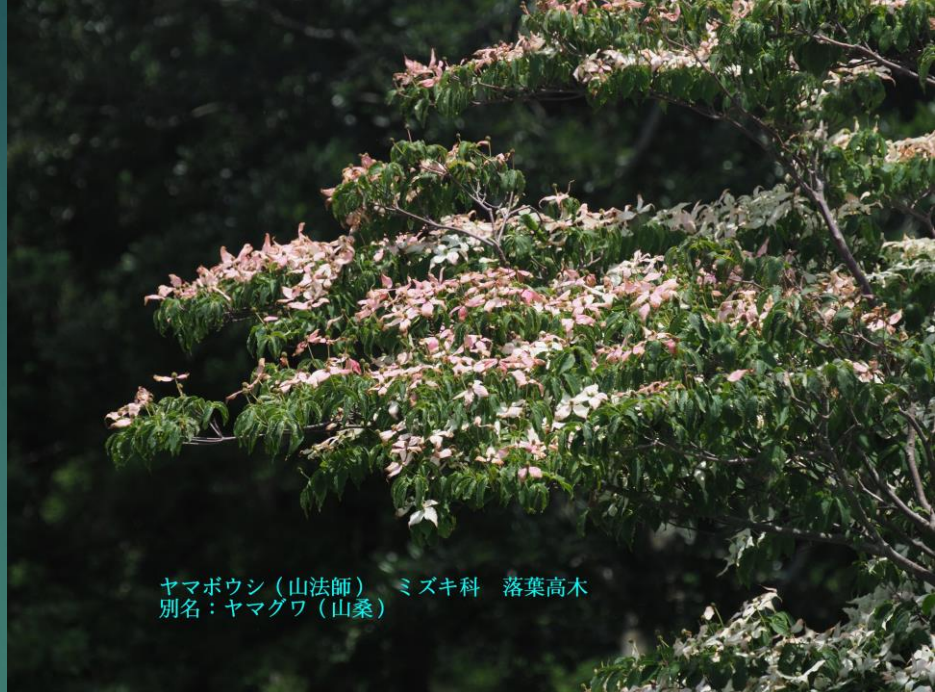
ヤマボウシ（山法師） ミズキ科 落葉高木 別名：ヤマグワ（山桑）