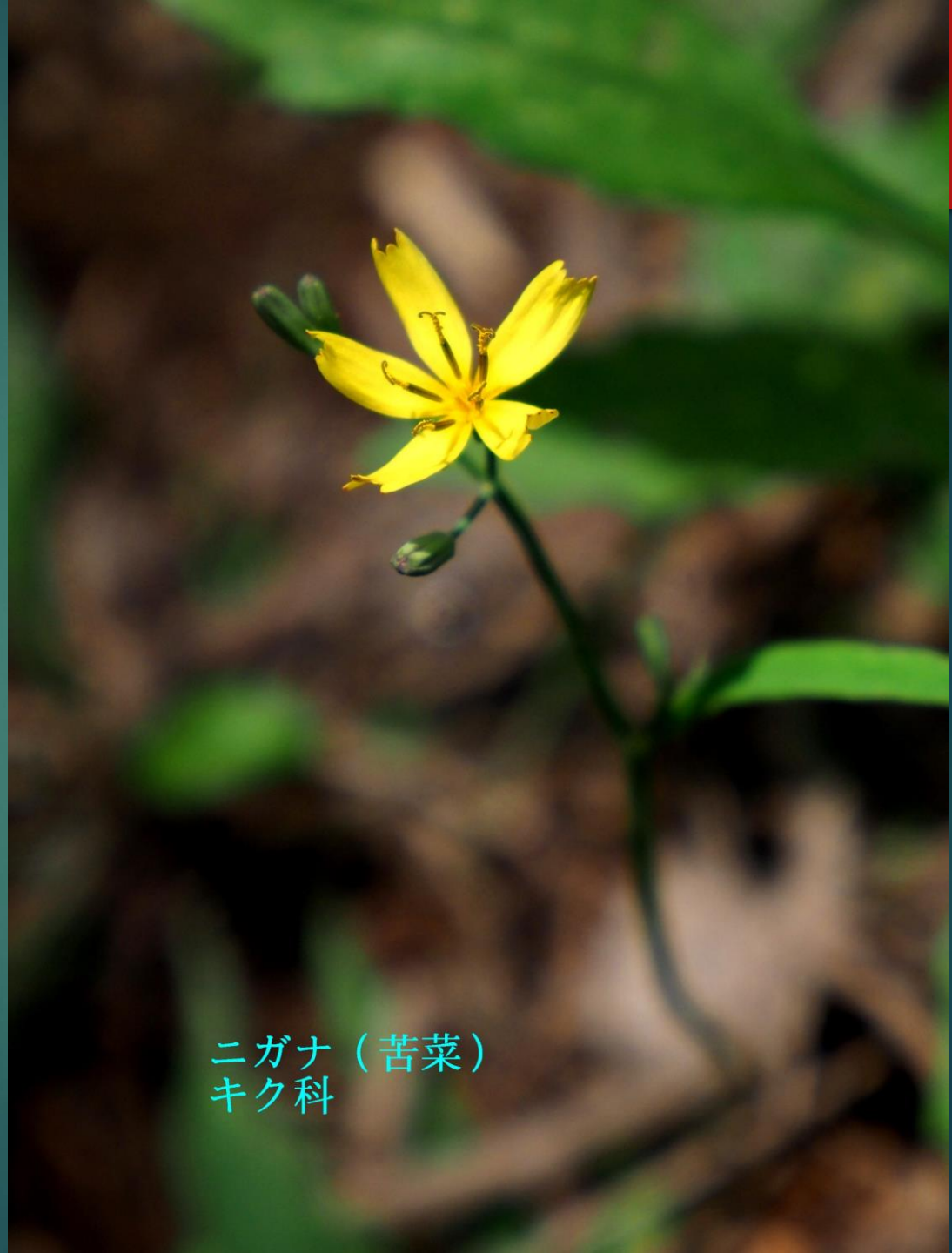
ニガナ (苦菜) キク科