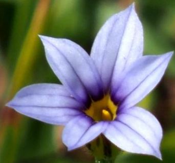
ニワゼキショウ（庭石菖） アヤメ科 帰化植物