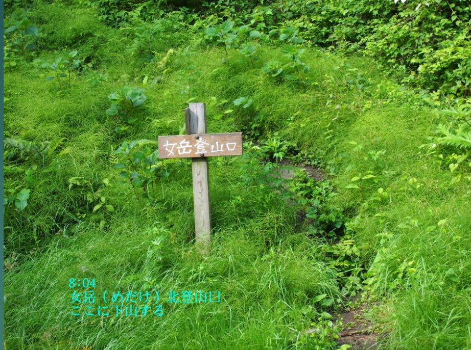
8:04 女岳（めだけ）北登山口 ここに下山する