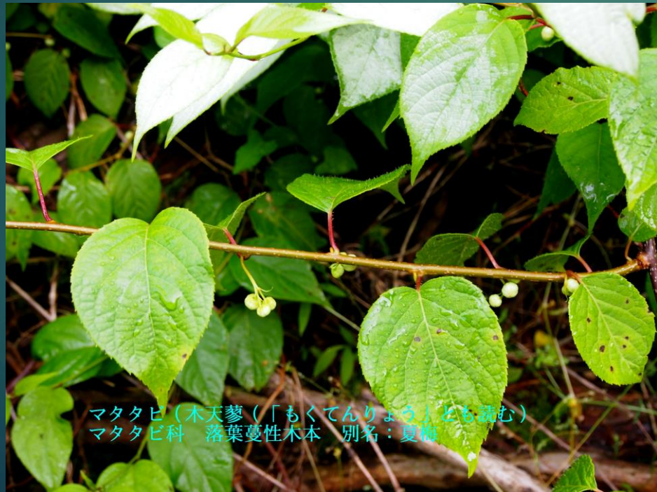
マタタビ (木天蓼 (「もくてんりょう」とも読む)) マタタビ科 落葉蔓性木本 別名：夏梅