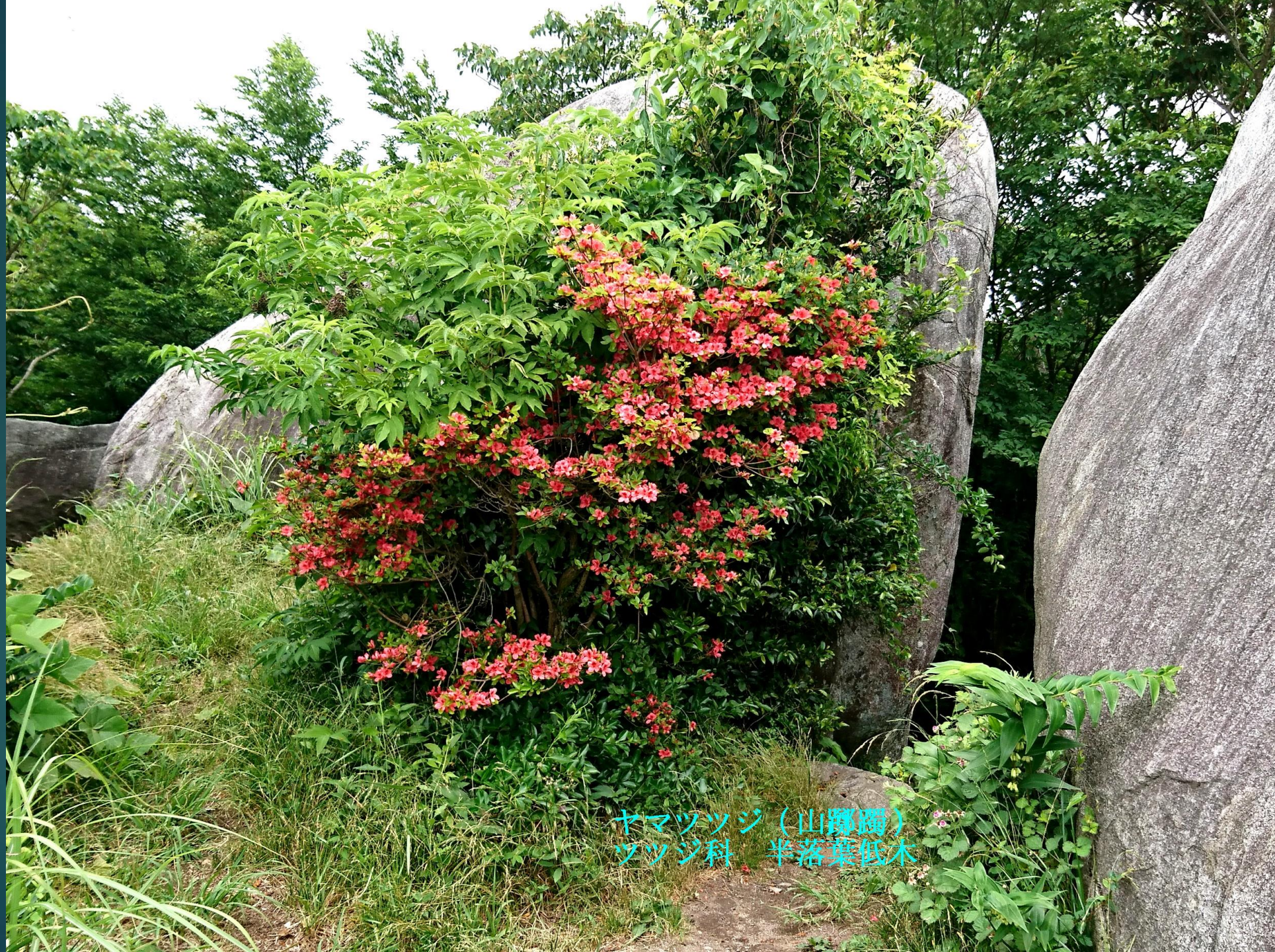
ヤマツツジ (山躑躅) ツツジ科 半落葉低木