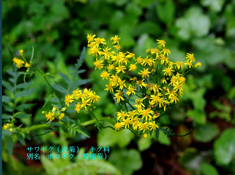
サワギク (沢菊) キク科 別名：ポロギク (樺樓菊)