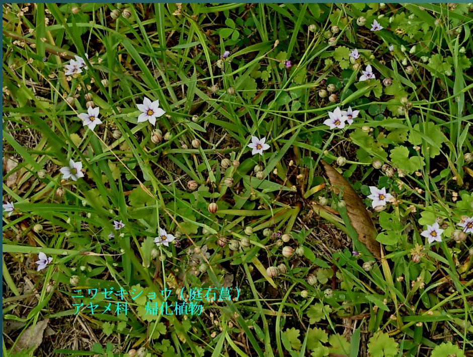
ニワゼキショウ (庭石菖) アヤメ科 帰化植物