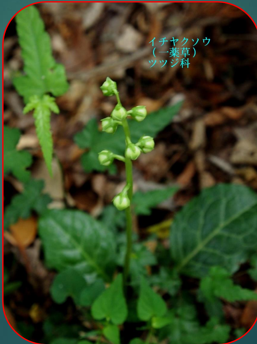
イチヤクソウ （一葉草） ツツジ科