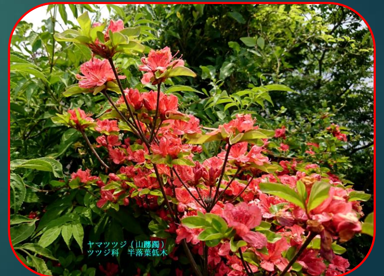
ヤマツツジ（山躑躅） ツツジ科 半落葉低木