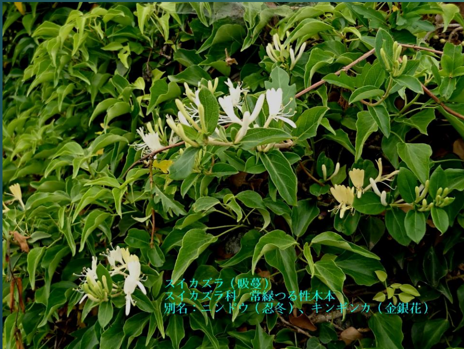
スイカズラ (吸蔓) スイカズラ科 常緑つる性木本 別名: ニンドウ (忍冬)、キンギンカ (金銀花)