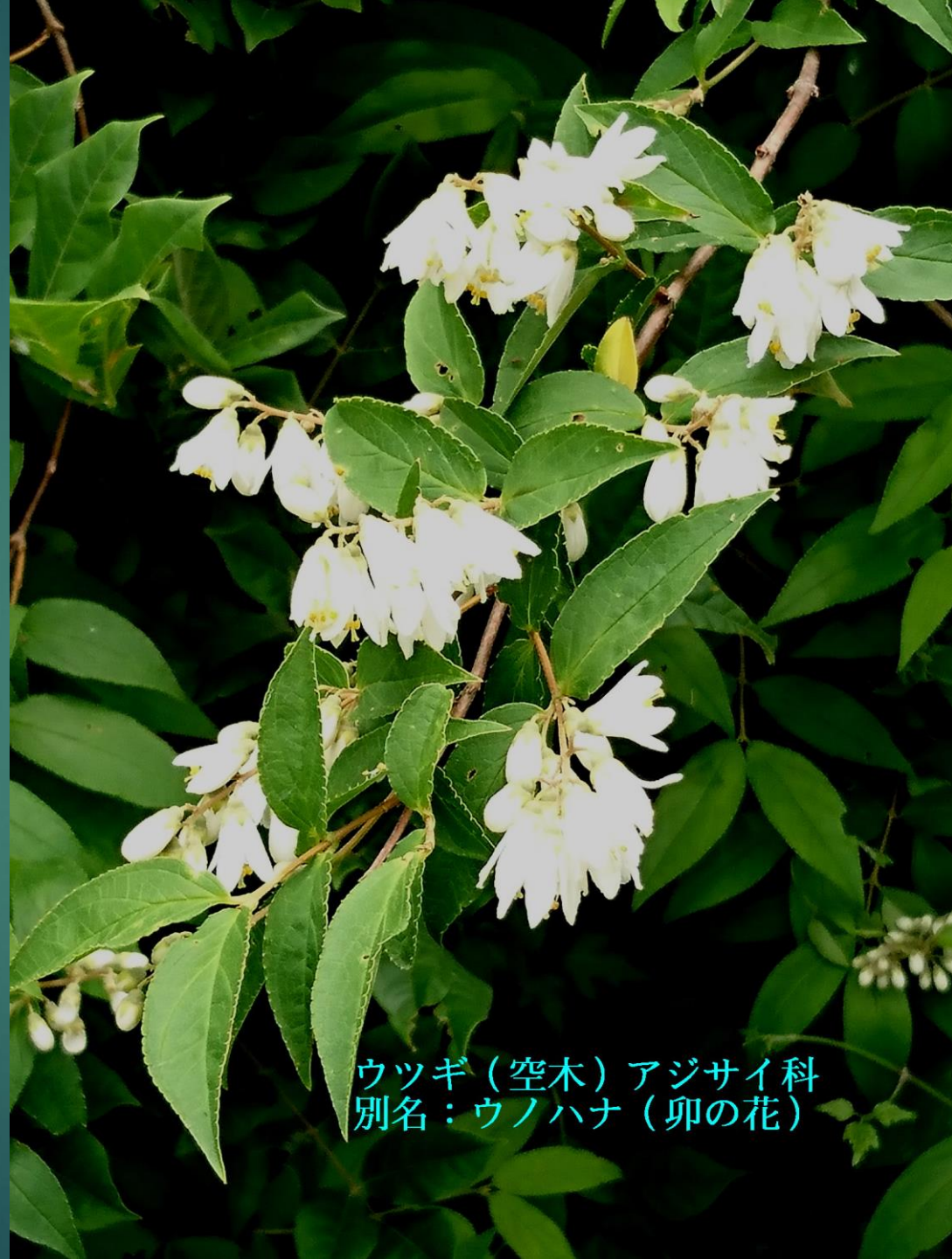
ウツギ（空木）アジサイ科 別名：ウノハナ（卵の花）