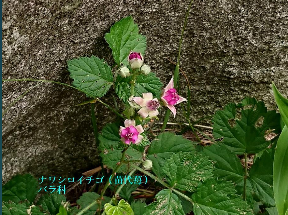
ナワシロイチゴ (苗代莓) バラ科