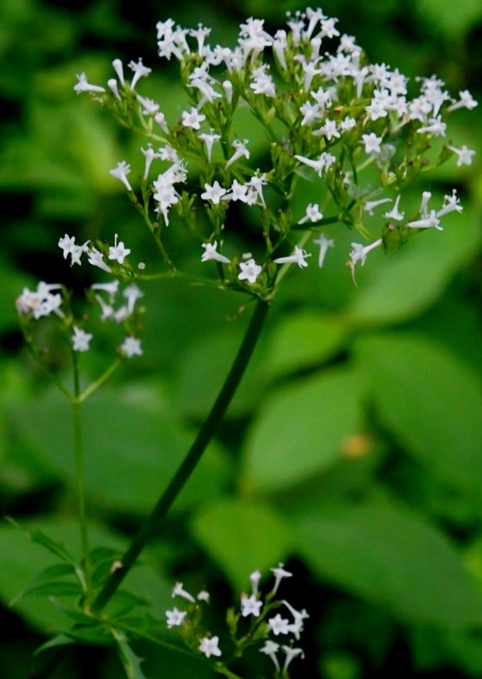
カノコソウ（鹿子草） オミナエシ科