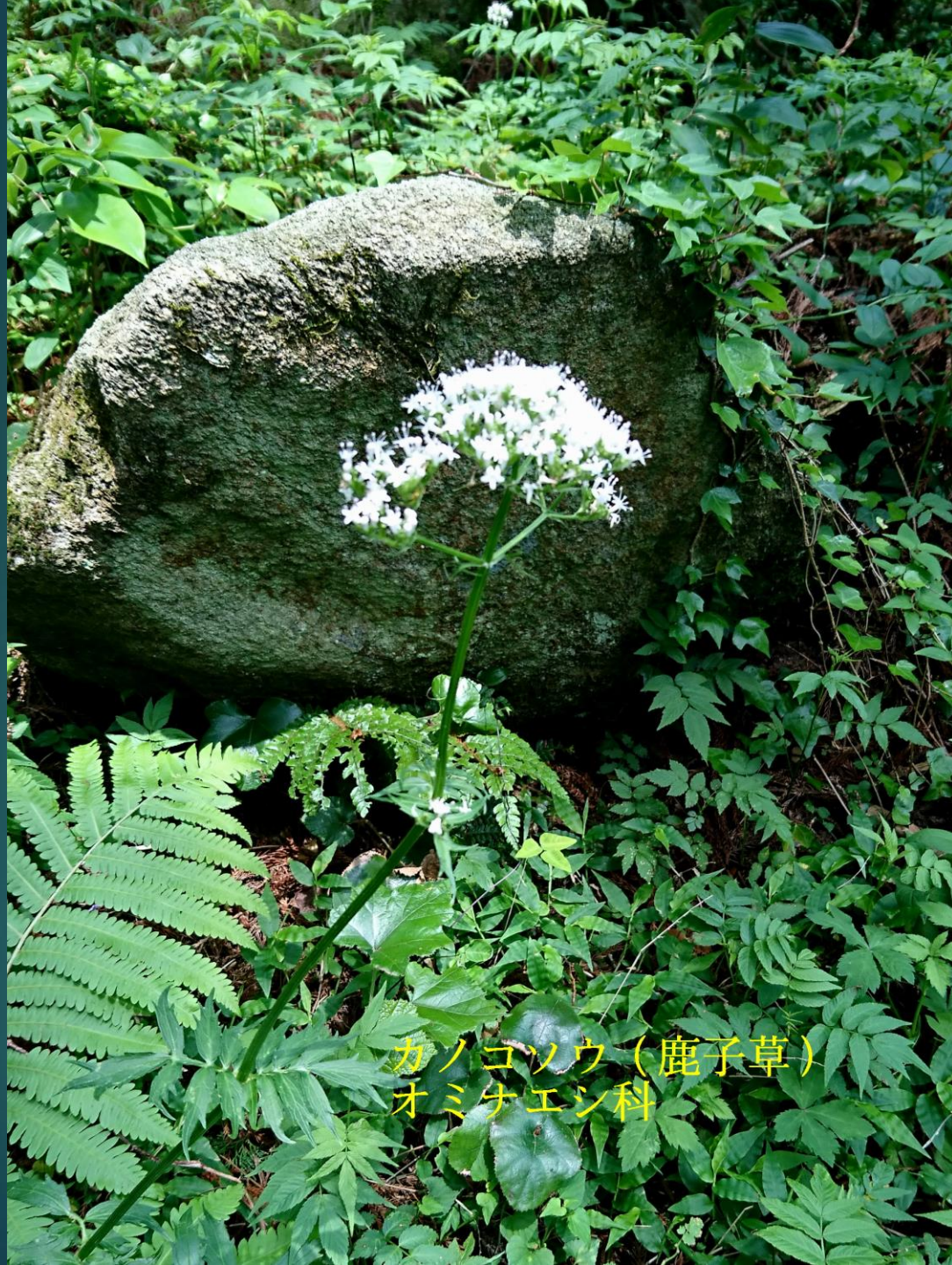
カノゴソウ（鹿子草） オミナエシ科