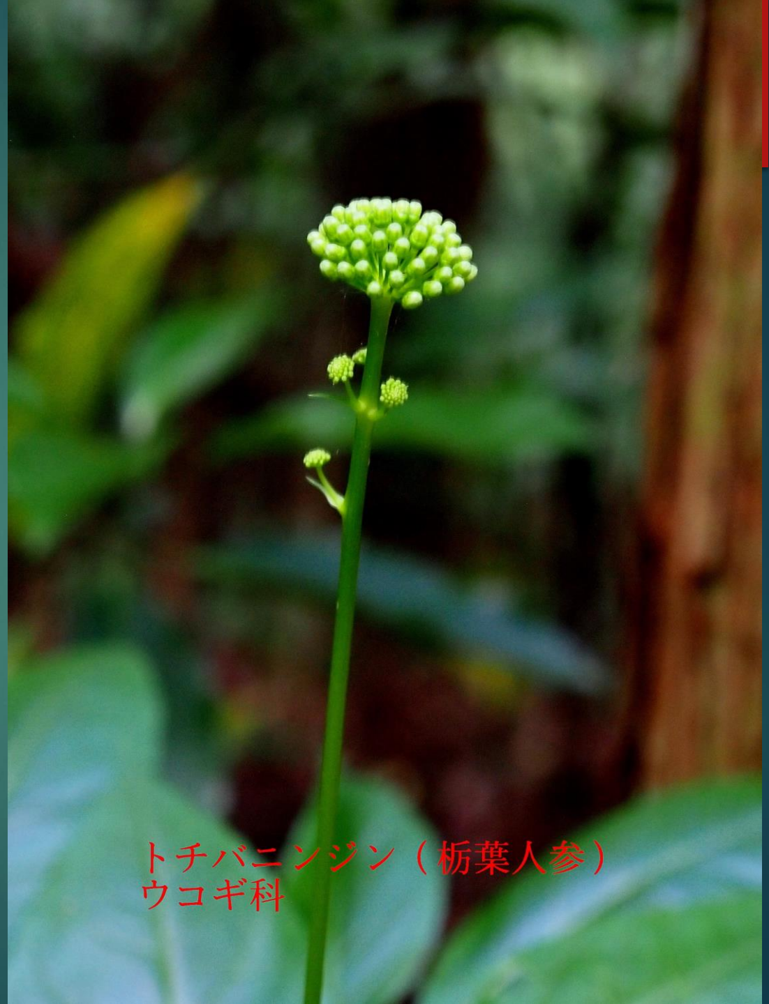
トチバニンジン (栃葉人参) ウコギ科