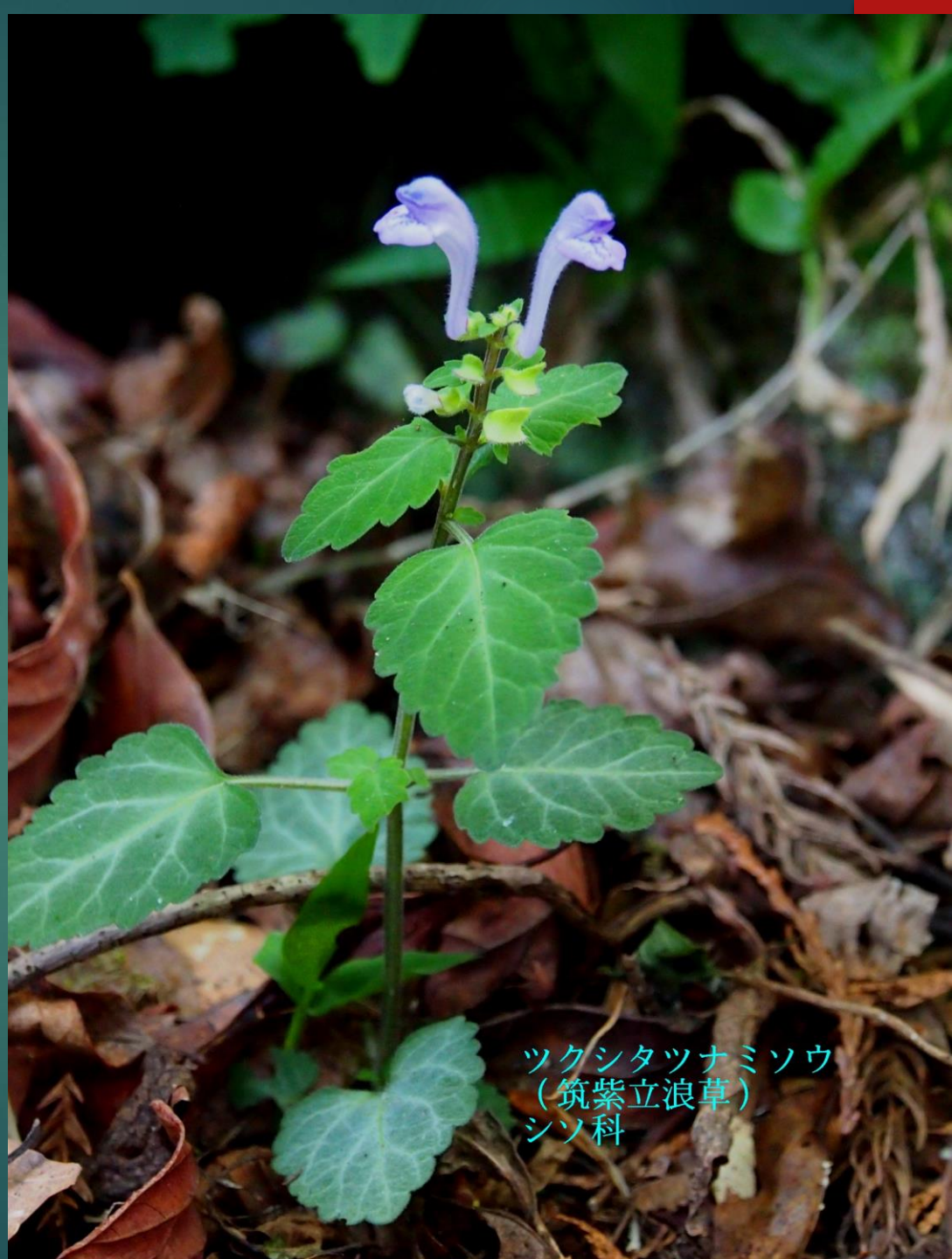
ツクシタツナミソウ (筑紫立浪草) シソ科