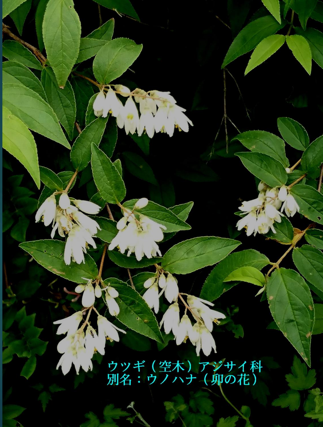
ウツギ（空木）アジサイ科 別名：ウノハナ（卵の花）