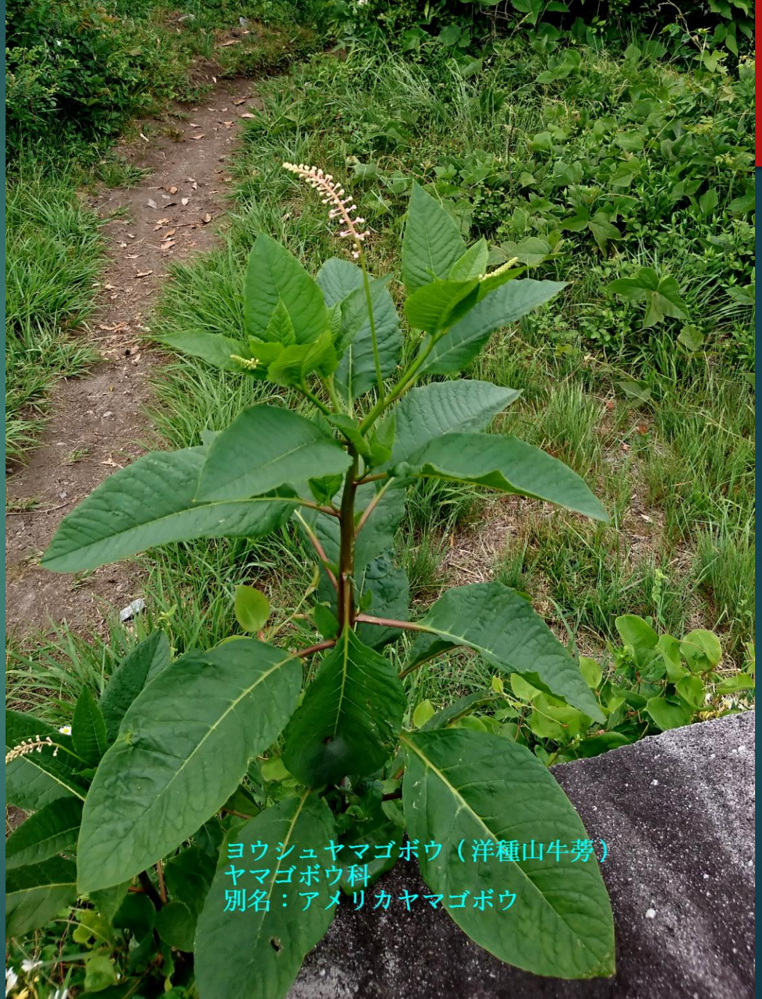
ヨウシュヤマゴボウ (洋種山牛蒡) ヤマゴボウ科 別名: アメリカヤマゴボウ