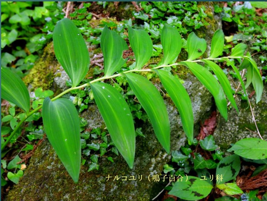
ナルコユリ (鳴子百合) ユリ科