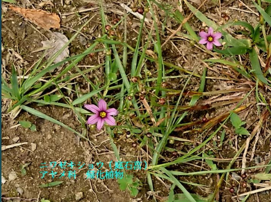
ニワゼキショウ (庭石菖) アヤメ科 帰化植物