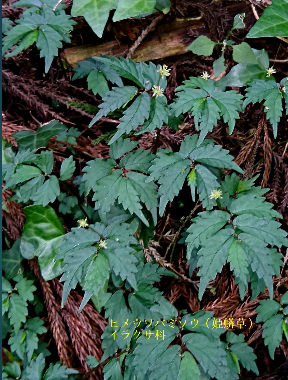
ヒメウワバミソウ (姫鱗草) イラクサ科