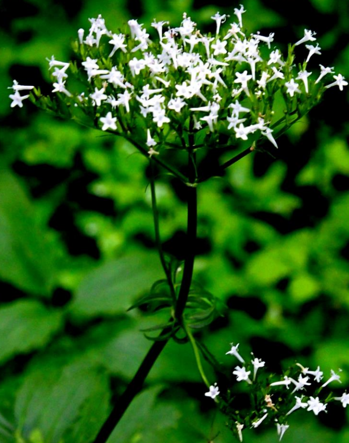
カノコソウ（鹿子草） オミナエシ科