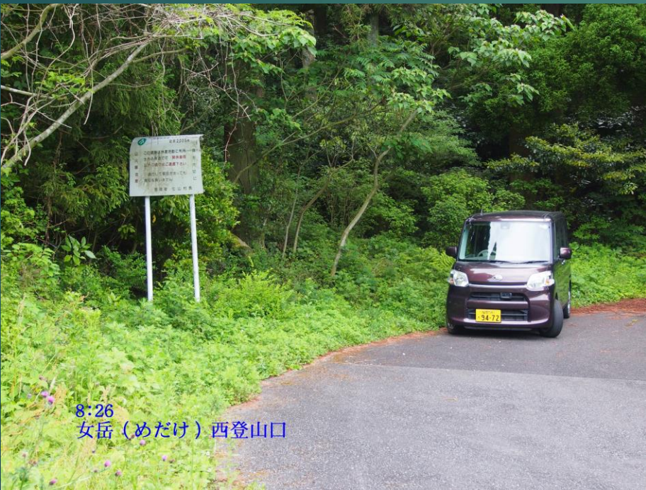
8:26 女岳（めだけ）西登山口