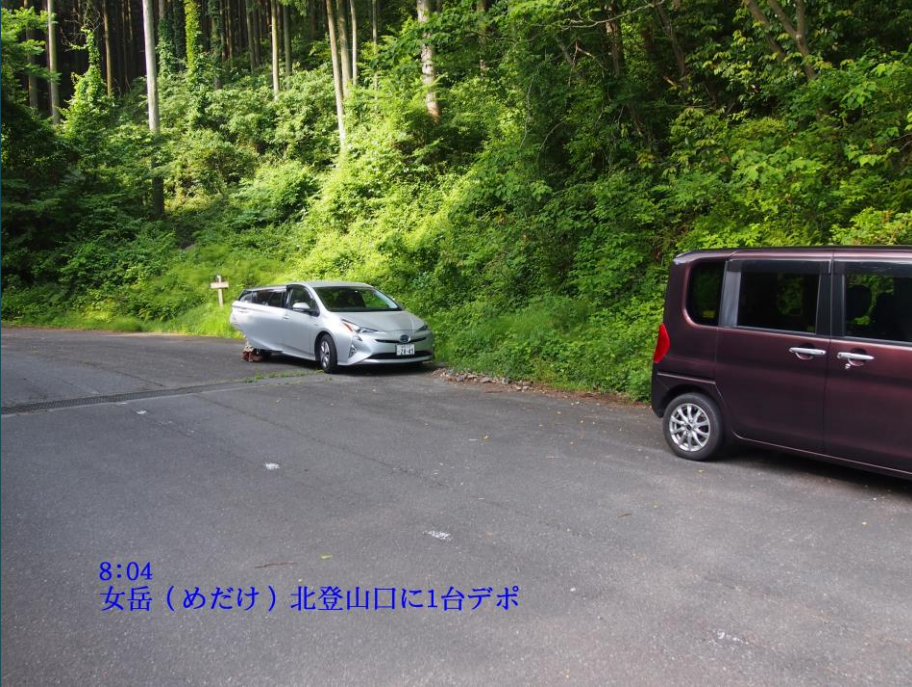
8:04 女岳（めだけ）北登山口に1台デポ