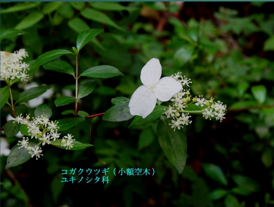
コガクウツギ (小額空木) ユキノシタ科