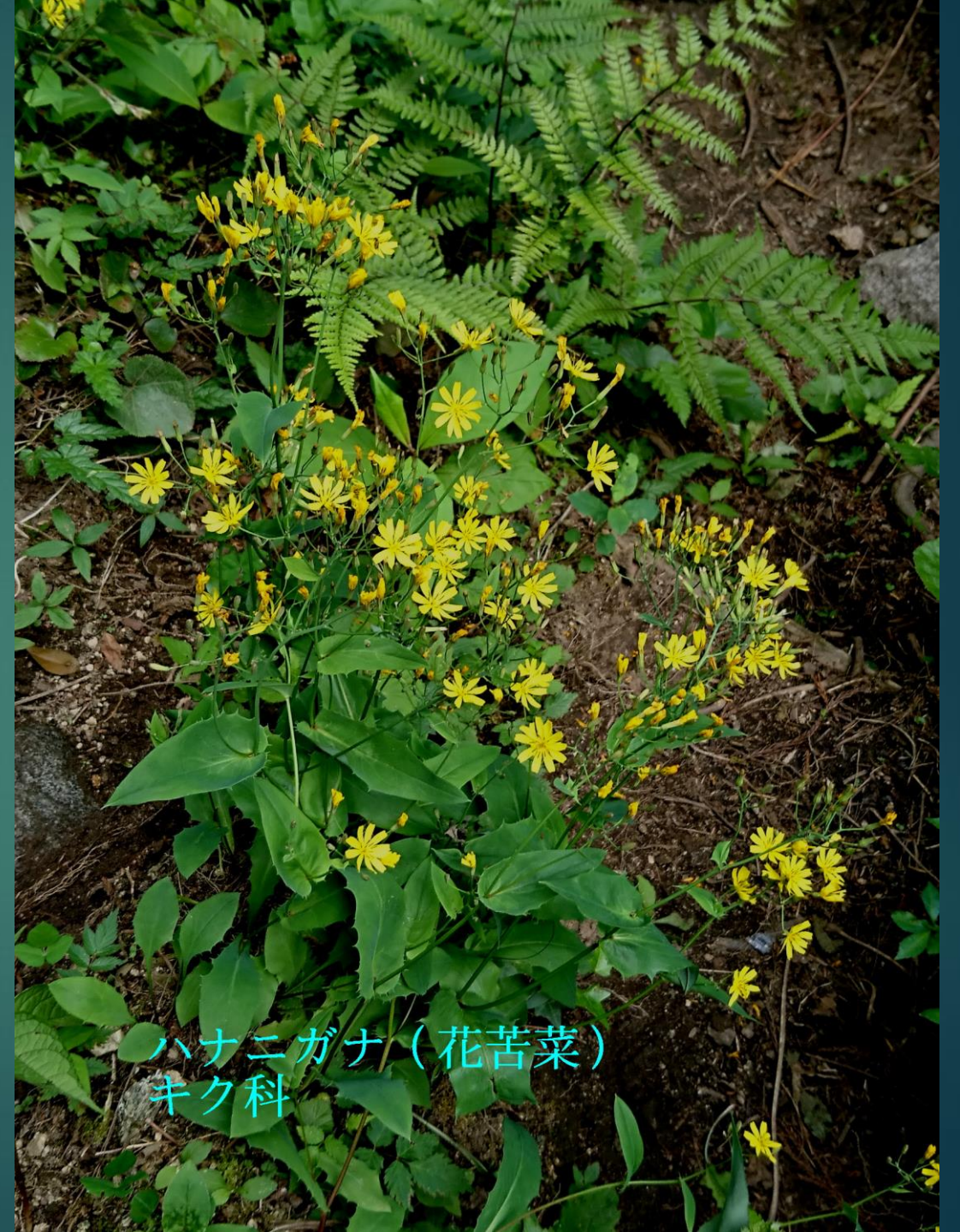
ハナニガナ (花苦菜) キク科