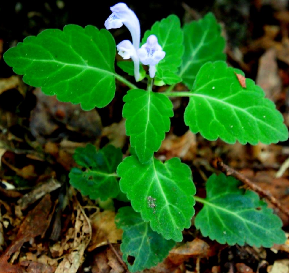
ツクシタツナミソウ (筑紫立浪草) シソ科