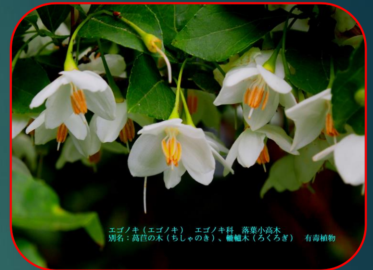
エゴノキ（エゴノキ） エゴノキ科 落葉小高木 別名：萇苳の木（ちしゃのき）、轆轤木（ろくろぎ） 有毒植物