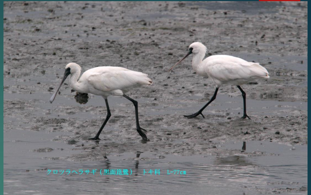
クロツラヘラサギ（黒面篋鷺） トキ科 L=77cm