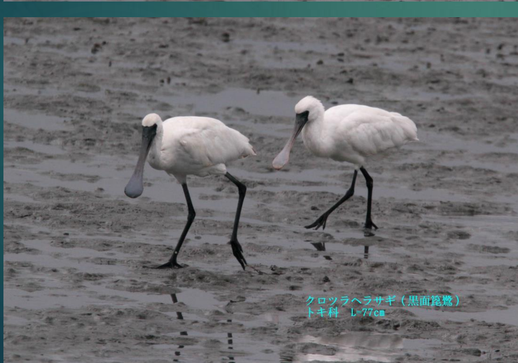
クロツラヘラサギ (黒面篋鷺) トキ科 L=77cm