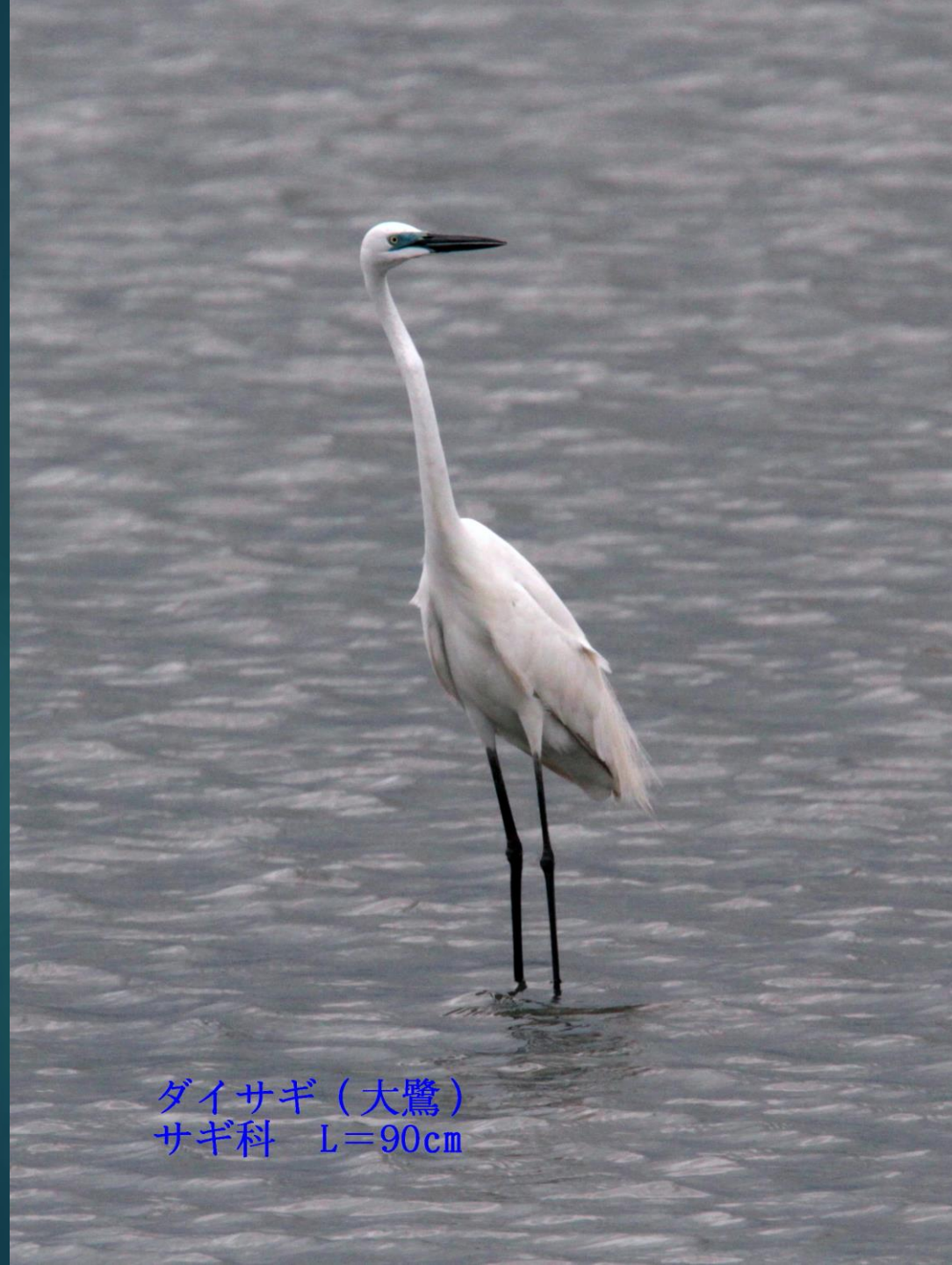
ダイサギ (大鷺) サギ科 L=90cm