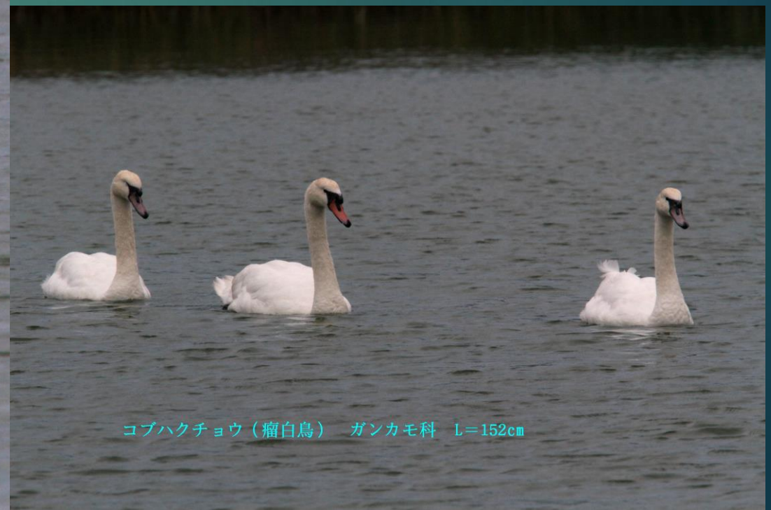
コブハクチョウ（瘤白鳥） ガンカモ科 L=152cm