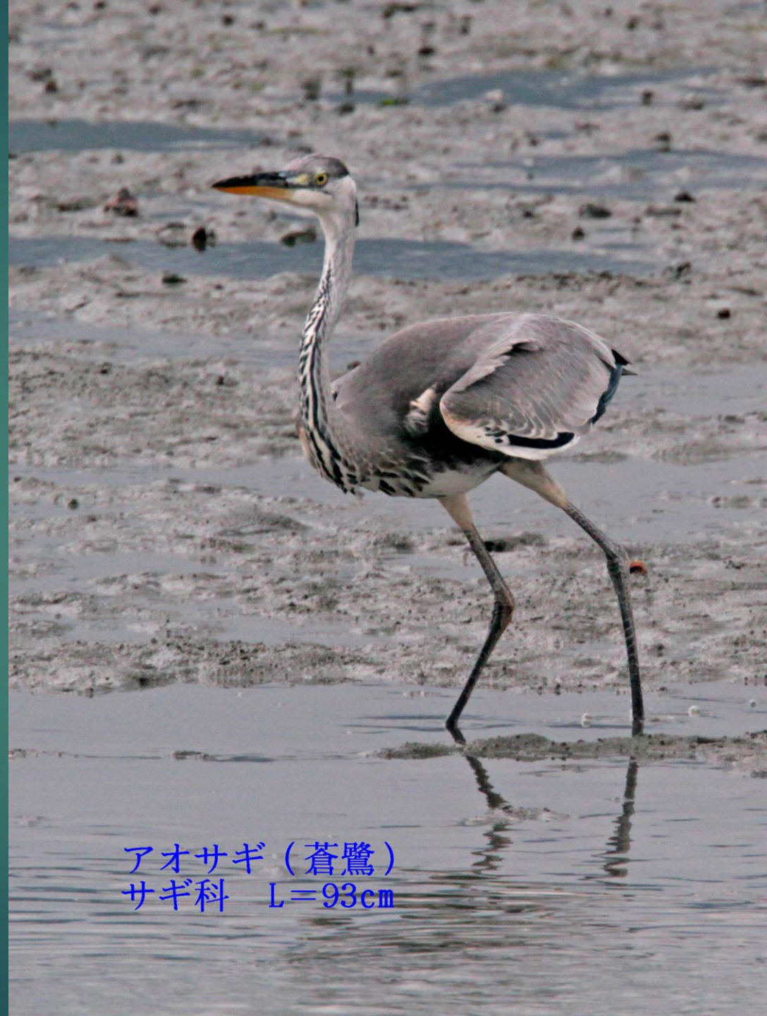
アオサギ (蒼鷺) サギ科 L=93cm