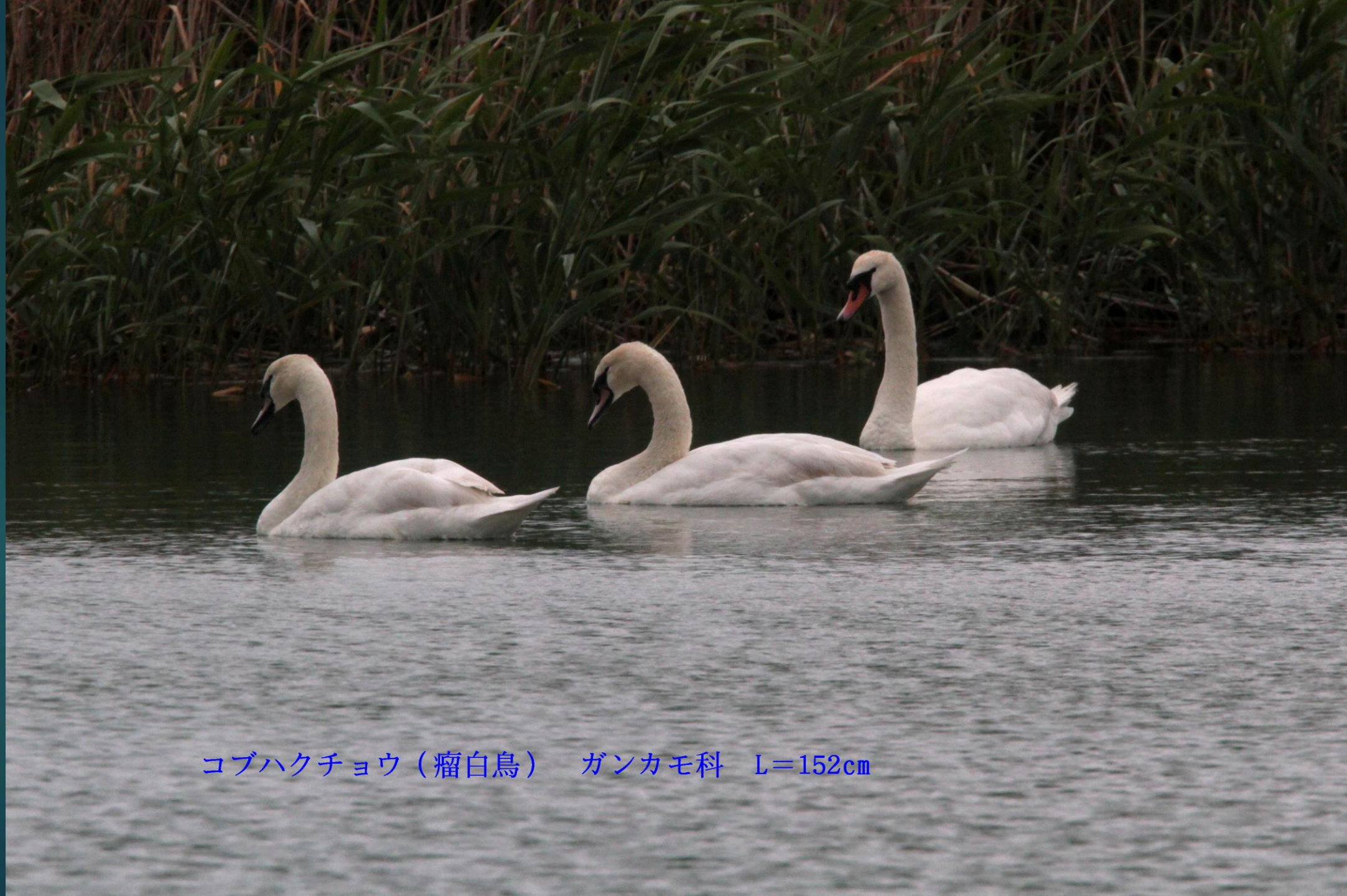
コブハクチョウ（瘤白鳥） ガンカモ科 L=152cm