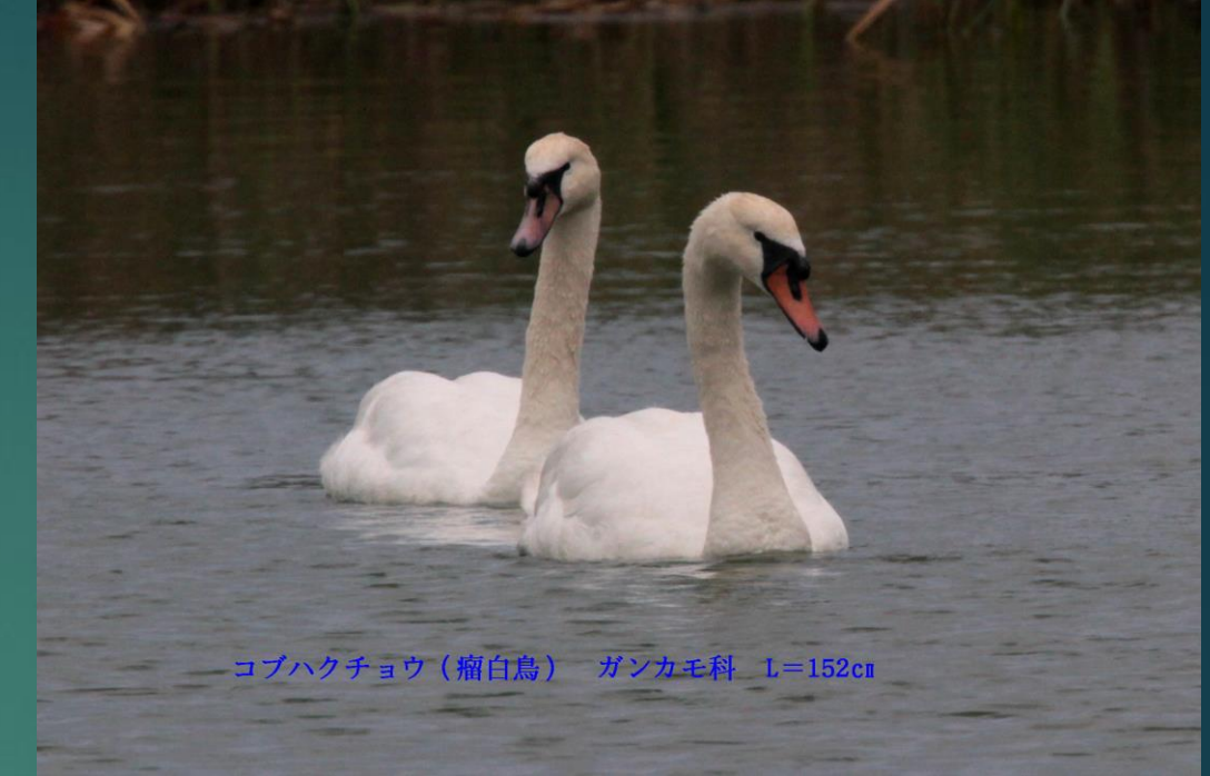
コブハクチョウ（瘤白鳥） ガンカモ科 L=152cm