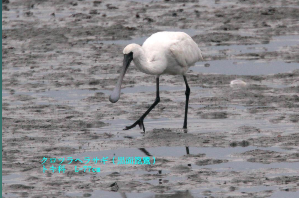
クロツラヘラサギ (黒面篋鷺) トキ科 L=77cm