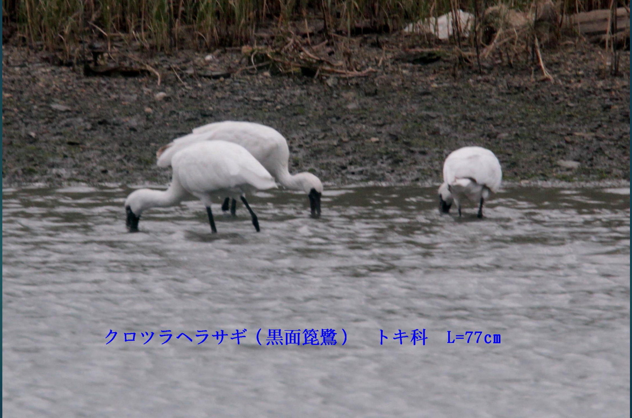
クロツラヘラサギ（黒面篋鷺） トキ科 L=77cm