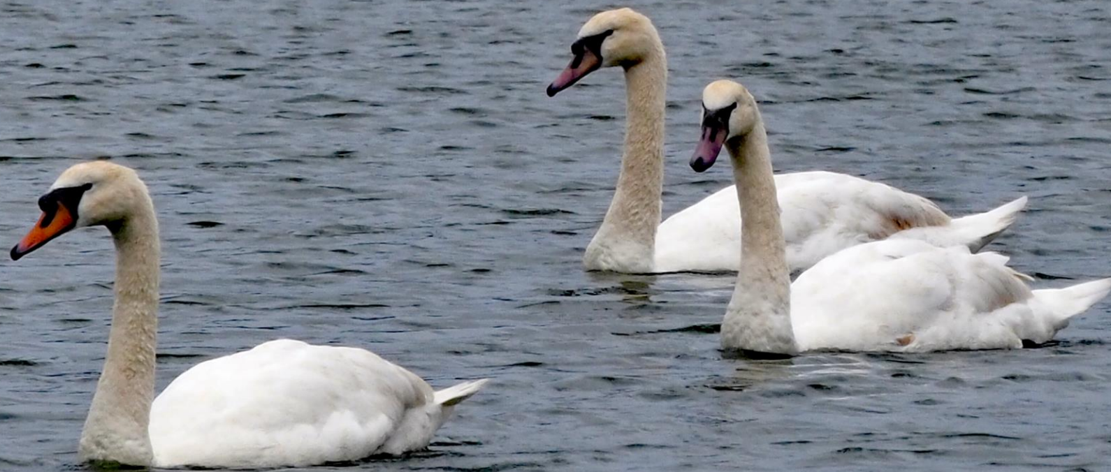
コブハクチョウ（瘤白鳥） ガンカモ科 L=152cm