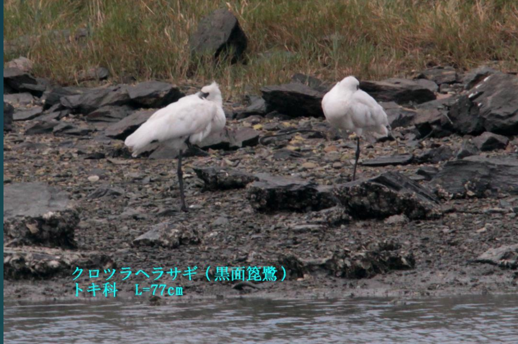
クロツラヘラサギ (黒面篋鷺) トキ科 L=77cm