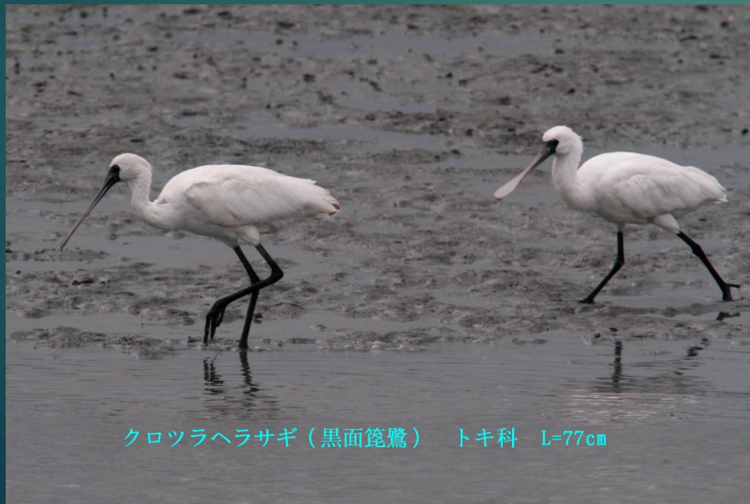
クロツラヘラサギ（黒面篋鷺） トキ科 L=77cm