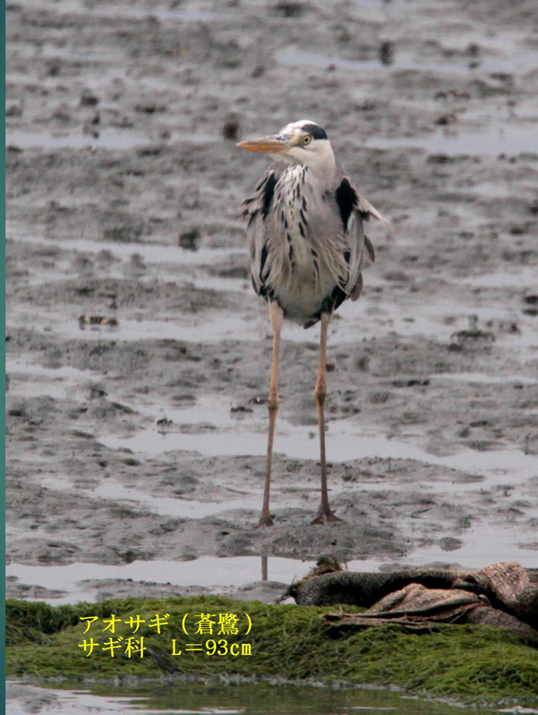
アオサギ (蒼鷺) サギ科 L=93cm