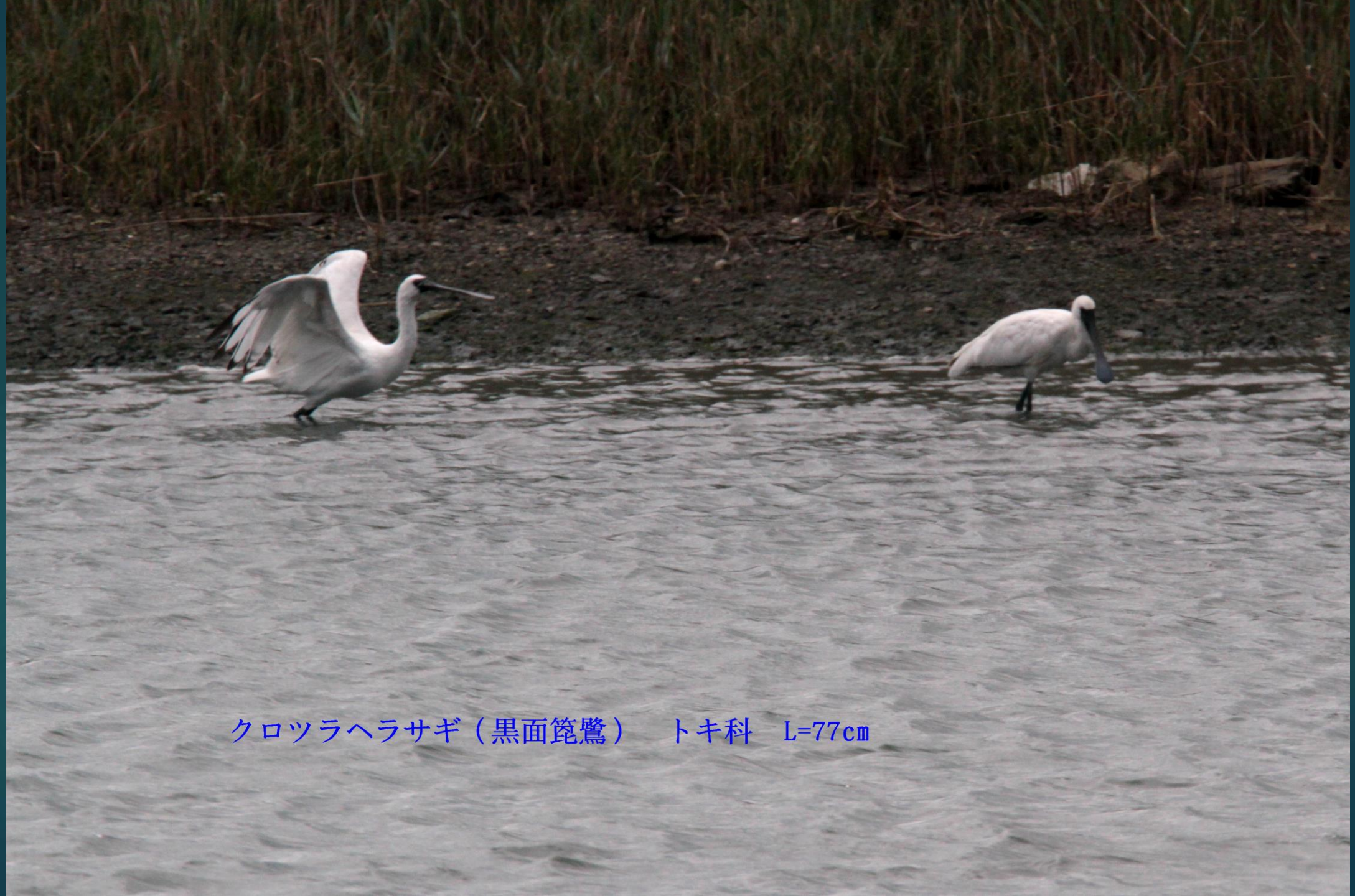
クロツラヘラサギ（黒面篋鷺） トキ科 L=77cm