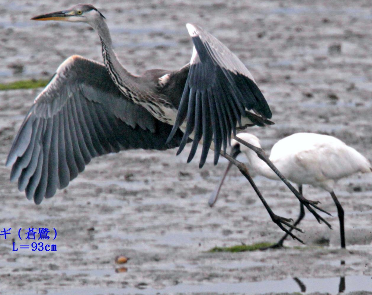
アオサギ (蒼鷺) サギ科 L=93cm