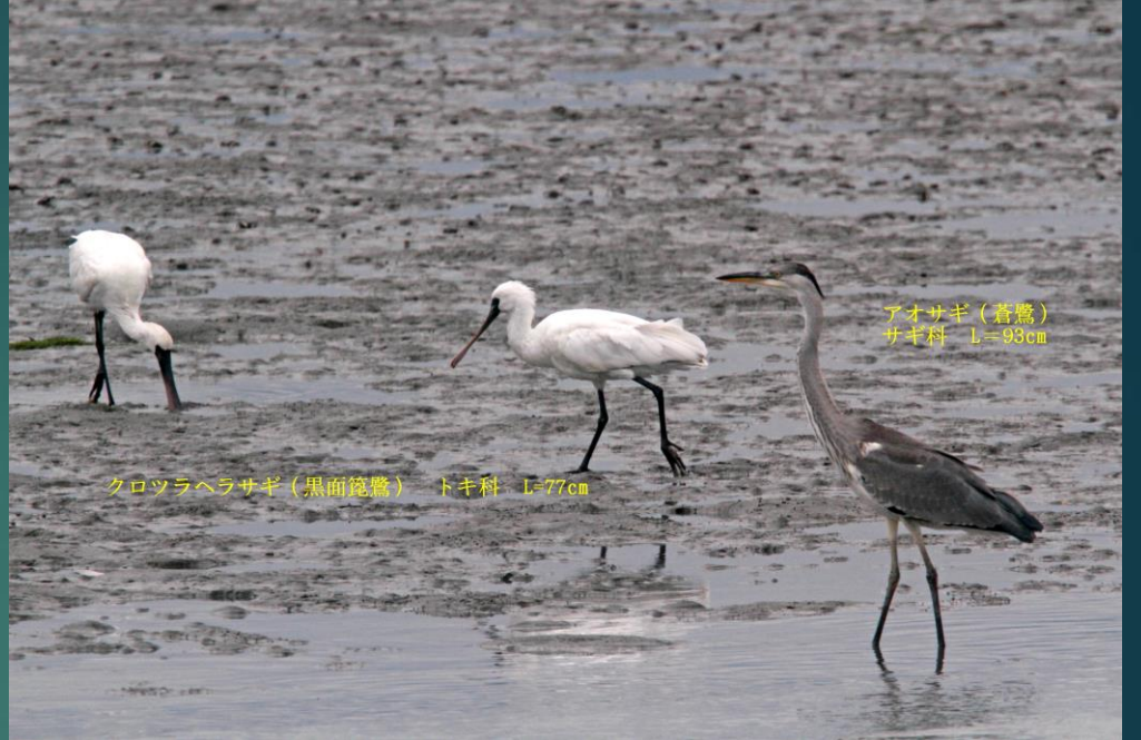
クロツラヘラサギ（黒面篋鷺） トキ科 L=77cm