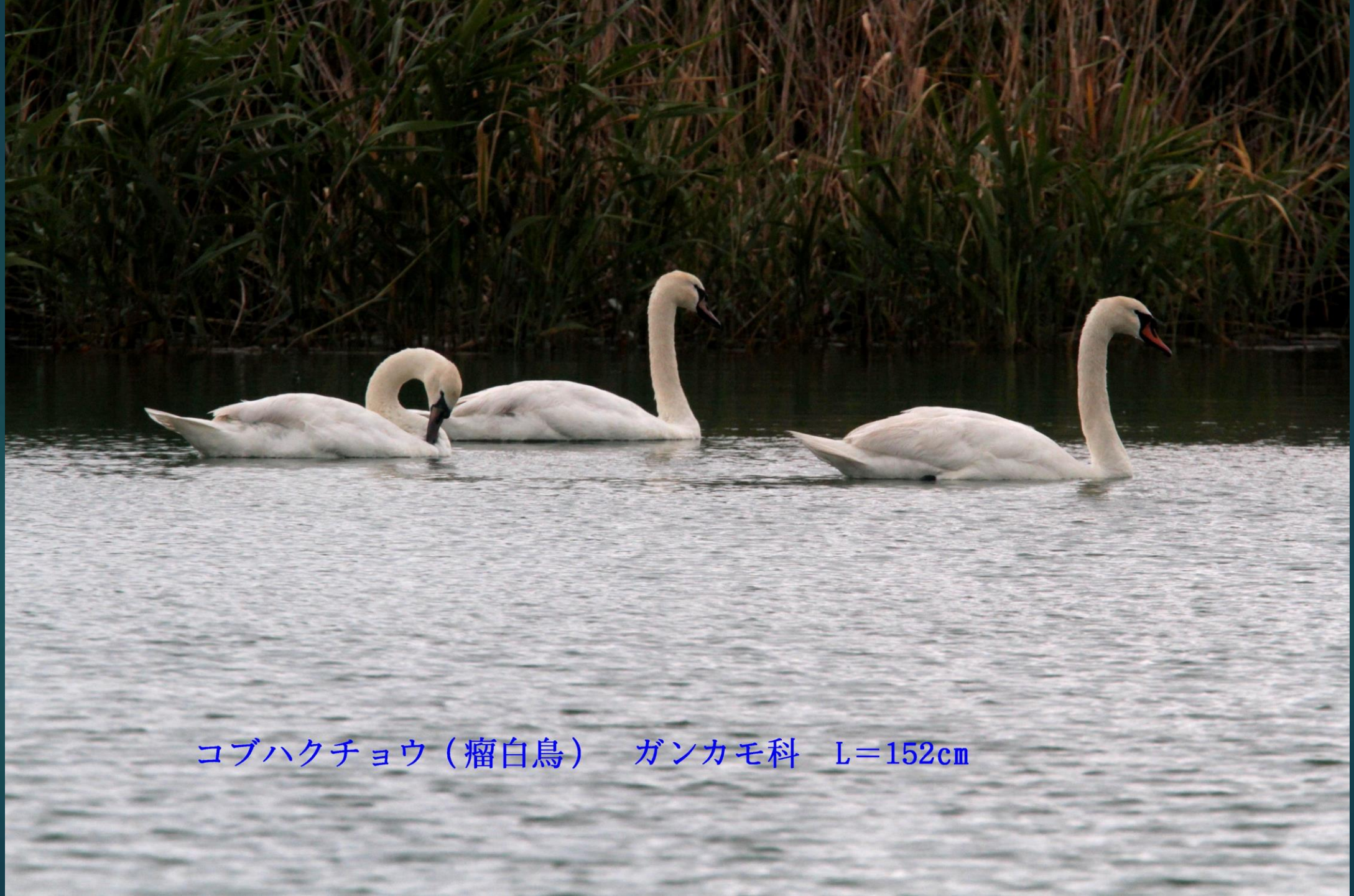
コブハクチョウ（瘤白鳥） ガンカモ科 L=152cm