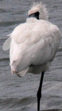
クロツラヘラサギ (黒面篋鷺) トキ科 L=77cm