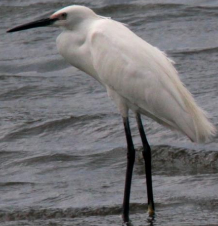
コサギ (小鷺) サギ科 L=61cm