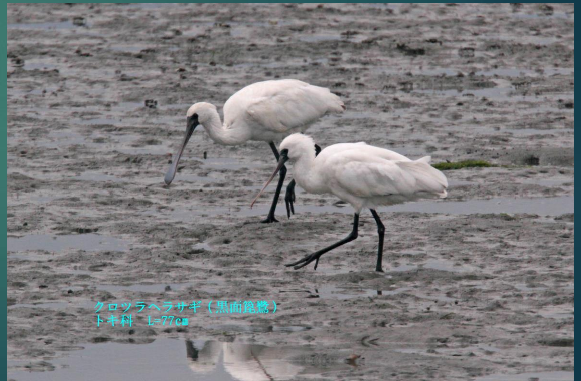
クロツラヘラサギ（黒面篋鷺） トキ科 L=77cm