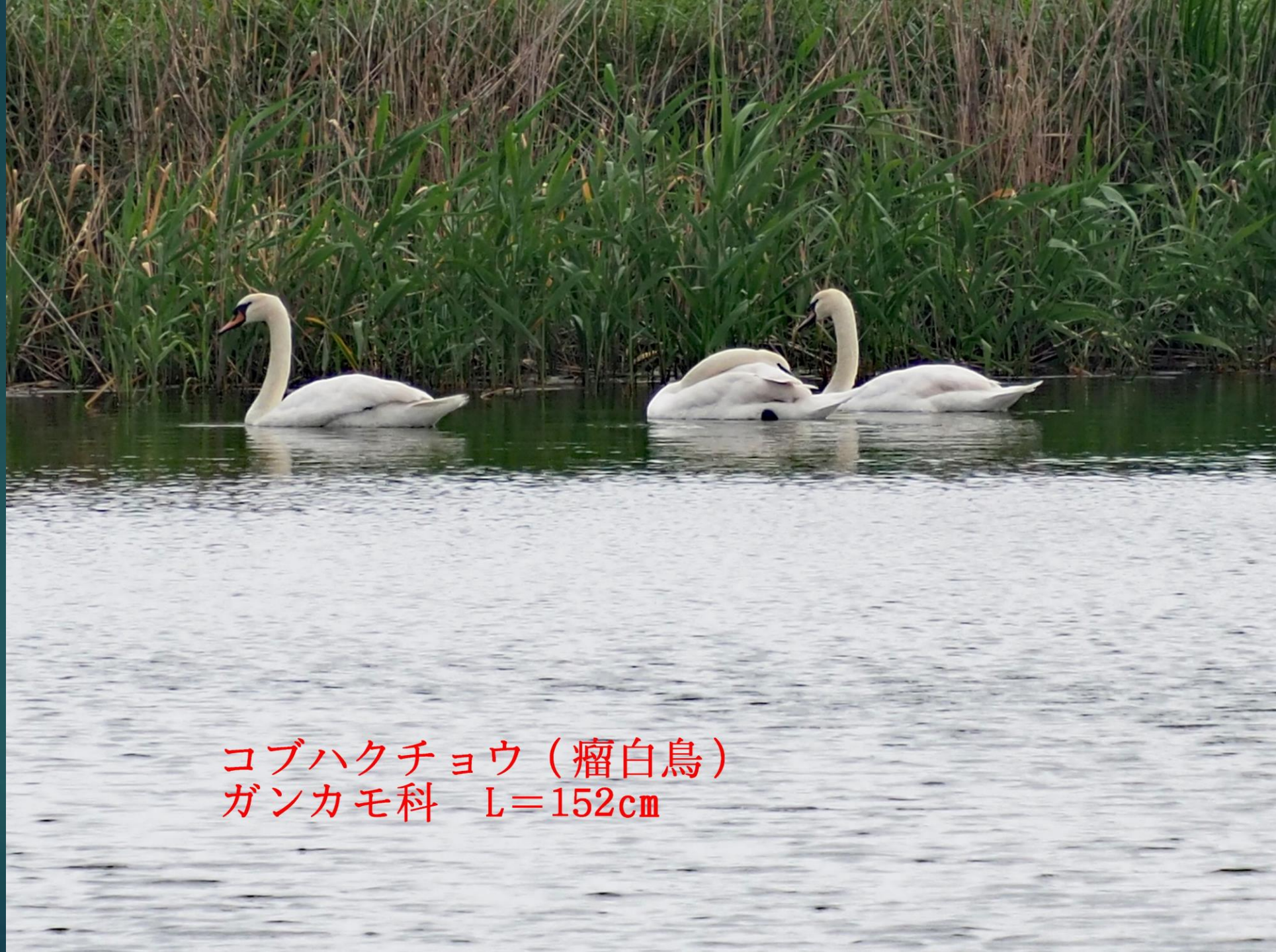
コブハクチョウ（瘤白鳥） ガンカモ科 L=152cm