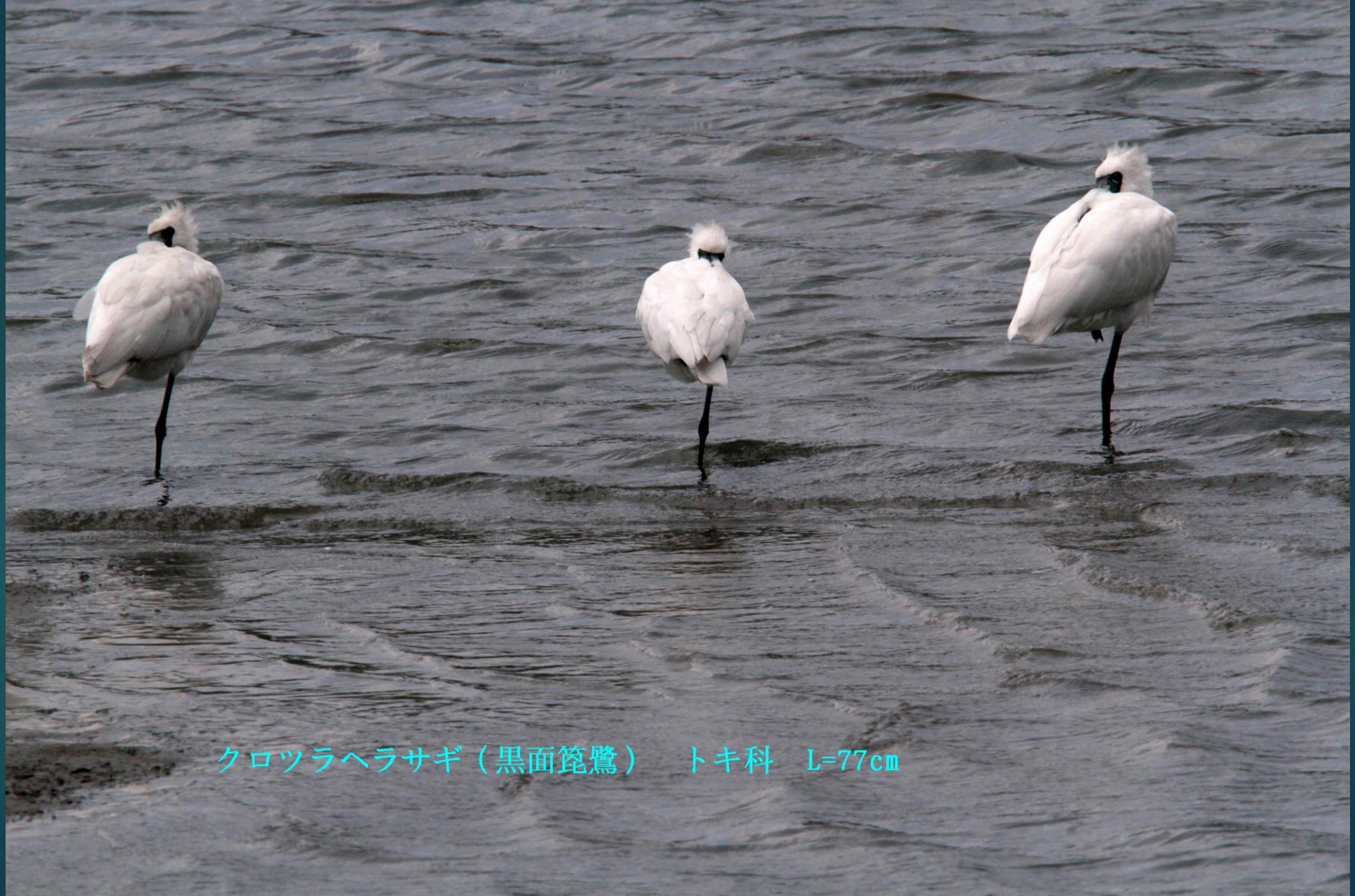
クロツラヘラサギ（黒面篋鷺） トキ科 L=77cm