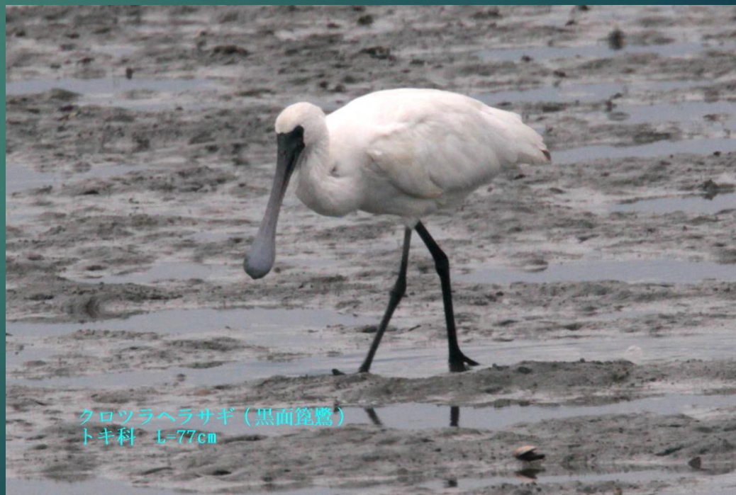
クロツラヘラサギ (黒面篋鷺) トキ科 L=77cm