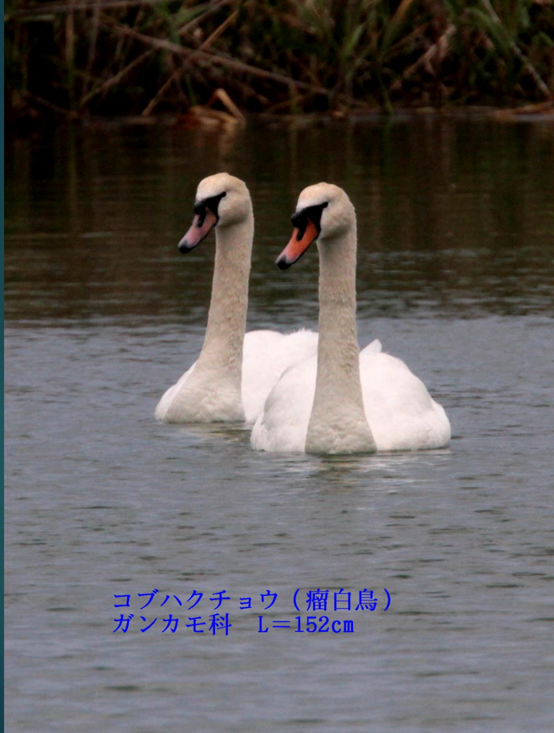
コブハクチョウ（瘤白鳥） ガンカモ科 L=152cm