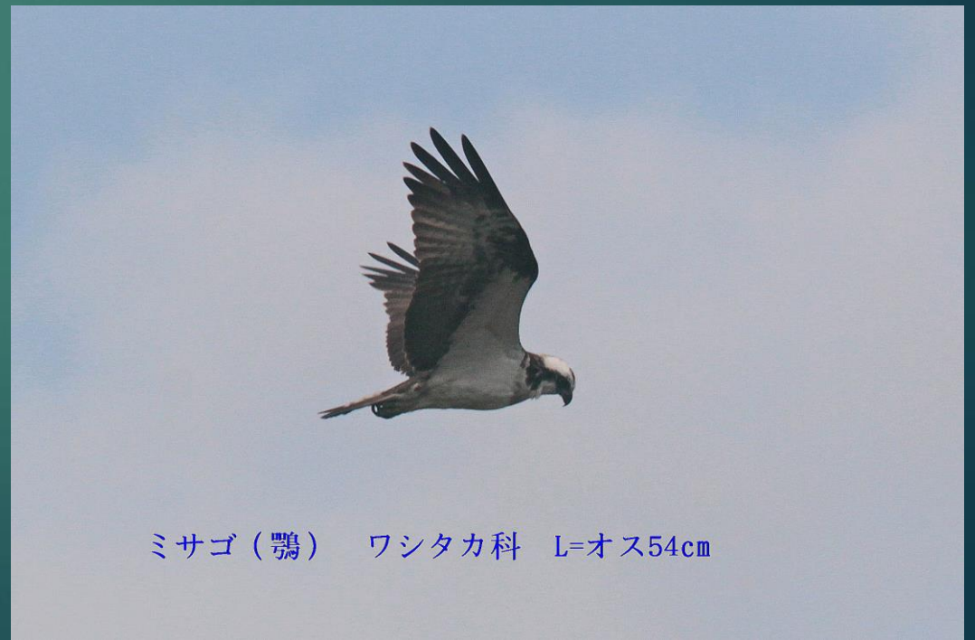
ミサゴ（鵟） ワシタカ科 L=オス54cm