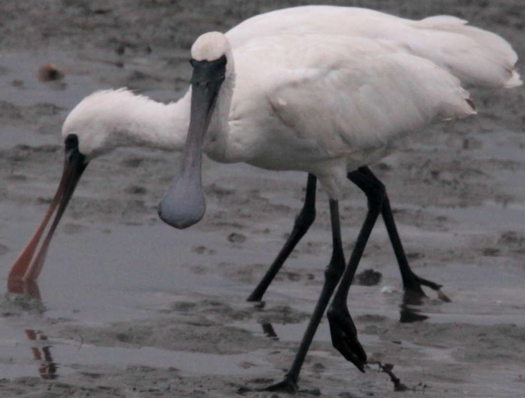
クロツラヘラサギ（黒面篋鷺） トキ科 L=77cm