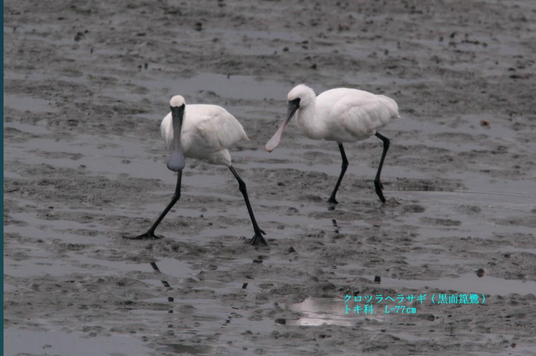
クロツラヘラサギ (黒面篋鷺) トキ科 L=77cm