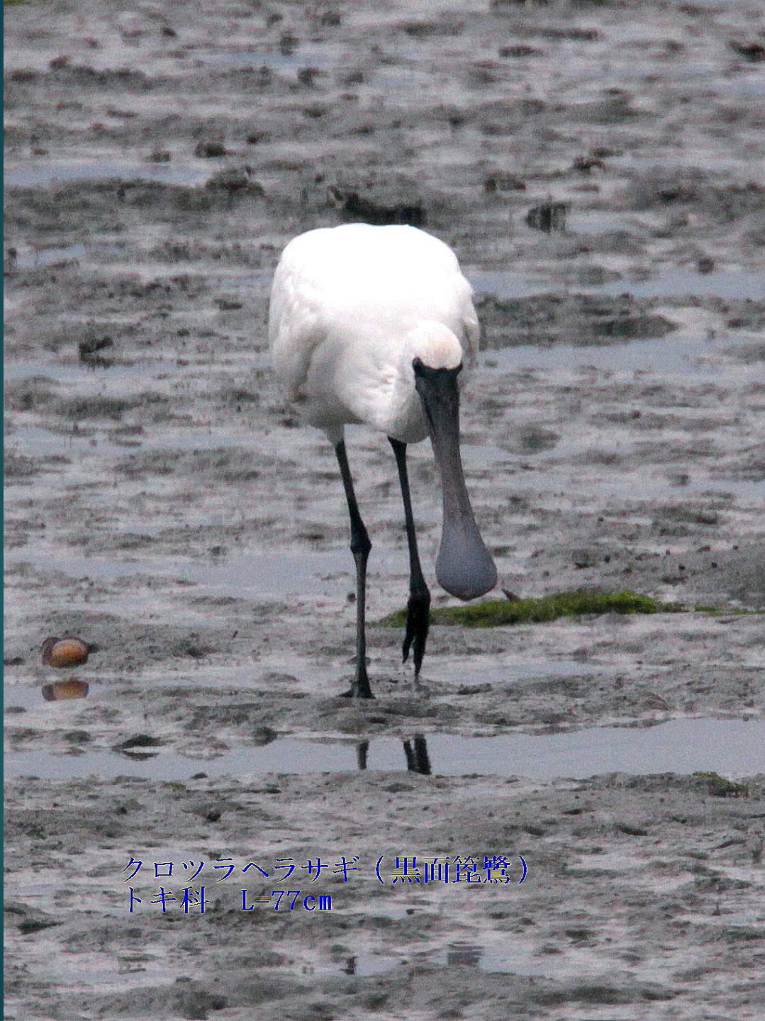
クロツラヘラサギ（黒面篋鷺） トキ科 L=77cm