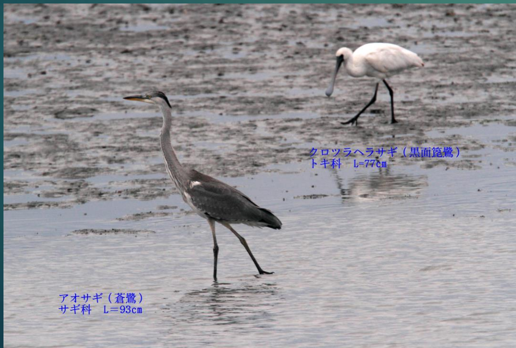
クロツラヘラサギ (黒面篋鷺) トキ科 L=77cm