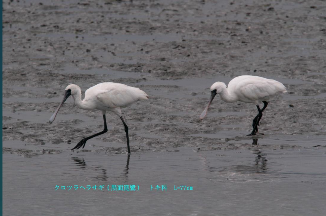
クロツラヘラサギ（黒面篋鷺） トキ科 L=77cm