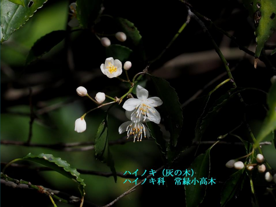
ハイノキ (灰の木) ハイノキ科 常緑小高木