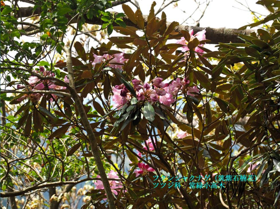
ツツジ科 常緑小高木 ツツジクナ (筑紫石楠花)