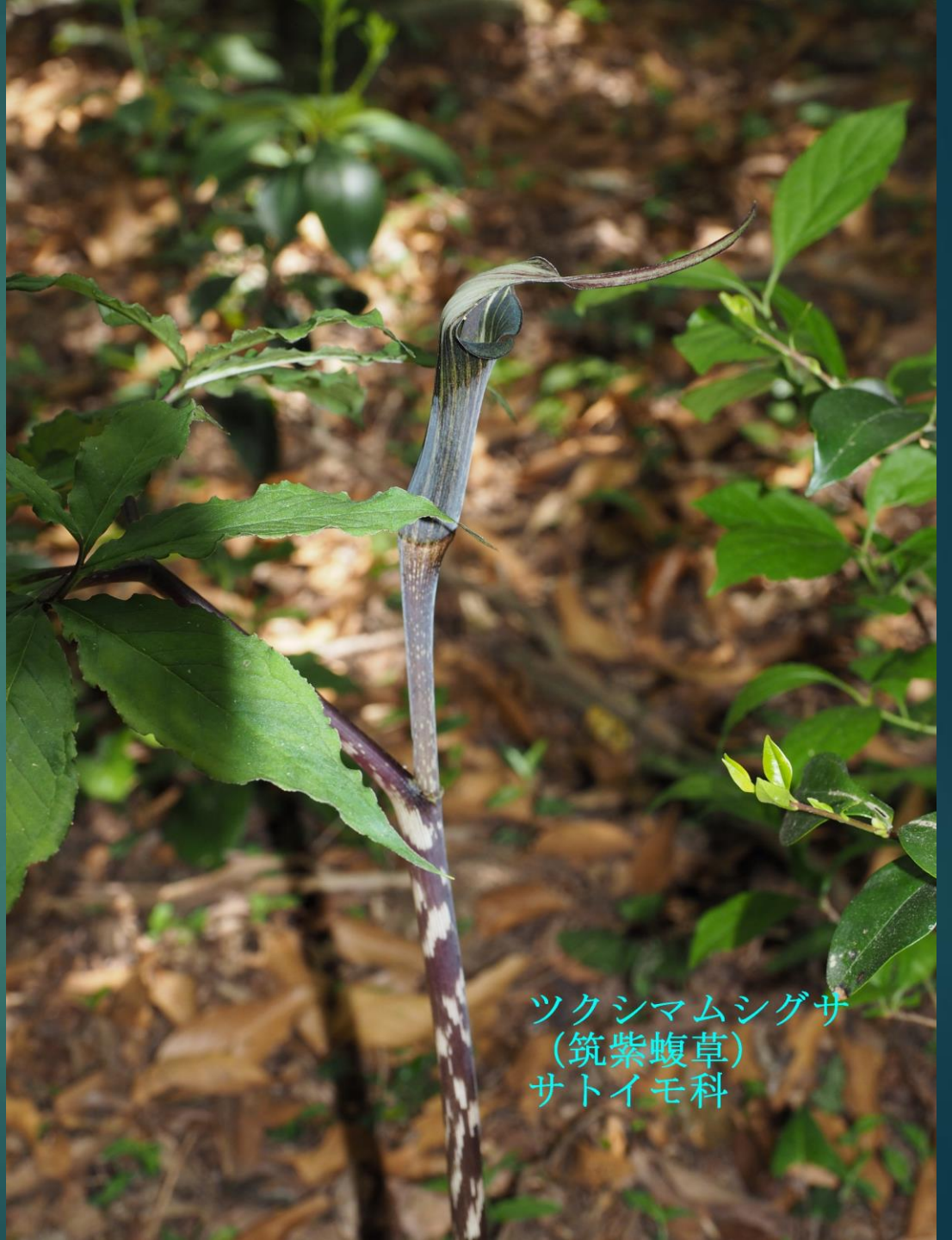
ツクシマムシグサ (筑紫蝮草) サトイモ科