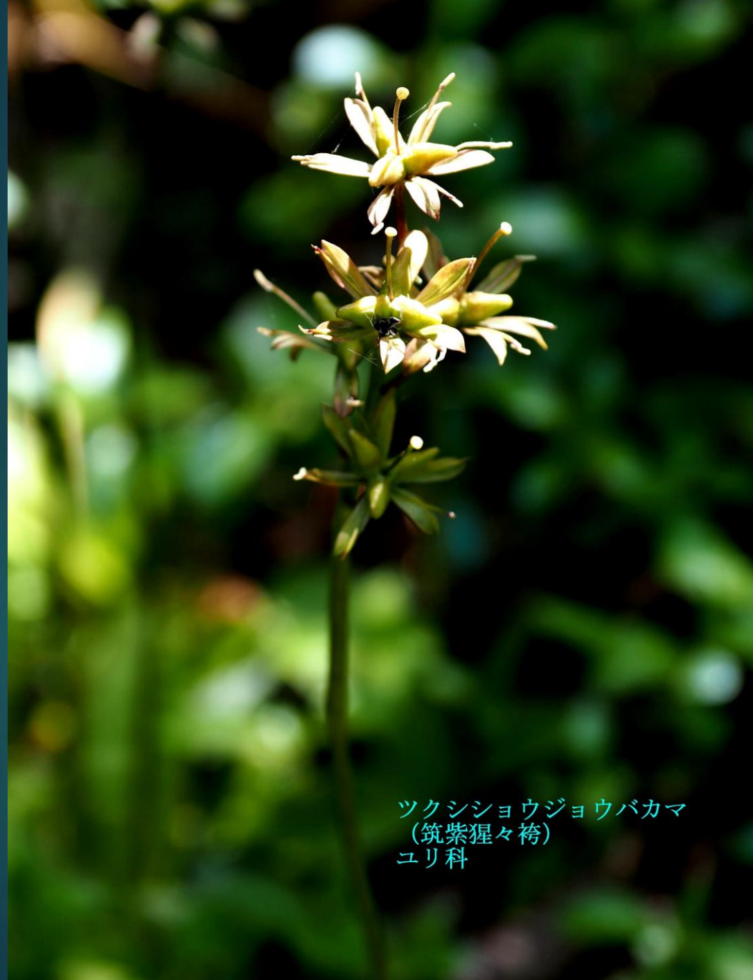
ツクシシヨウジョウバカマ (筑紫猩々袴) ユリ科