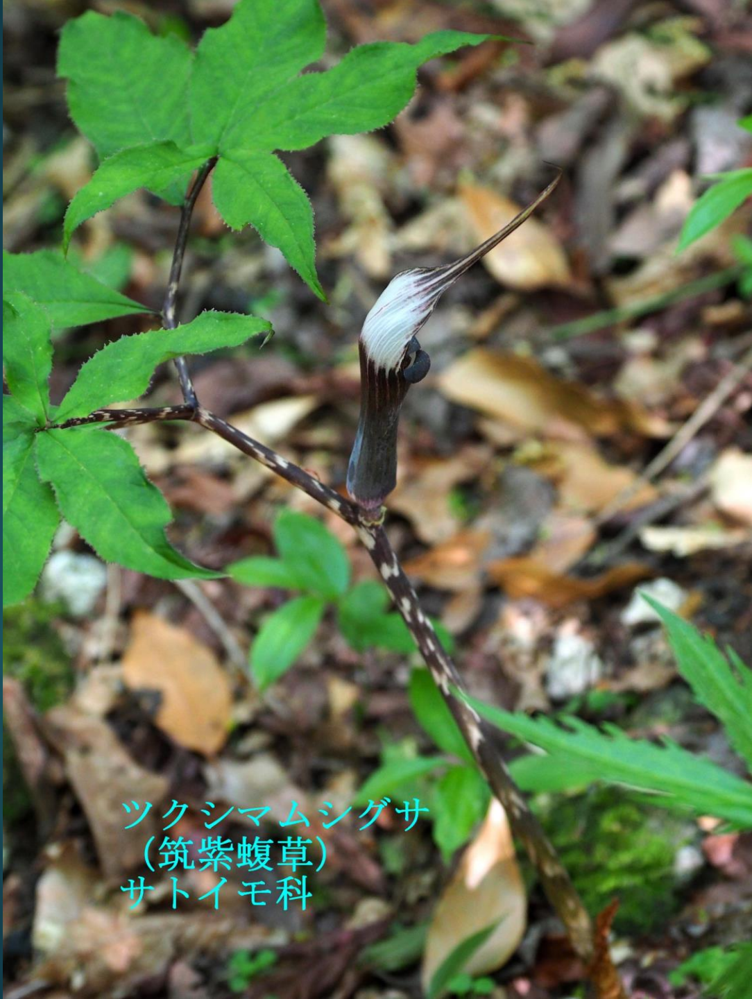
ツクシマムシグサ (筑紫蝮草) サトイモ科