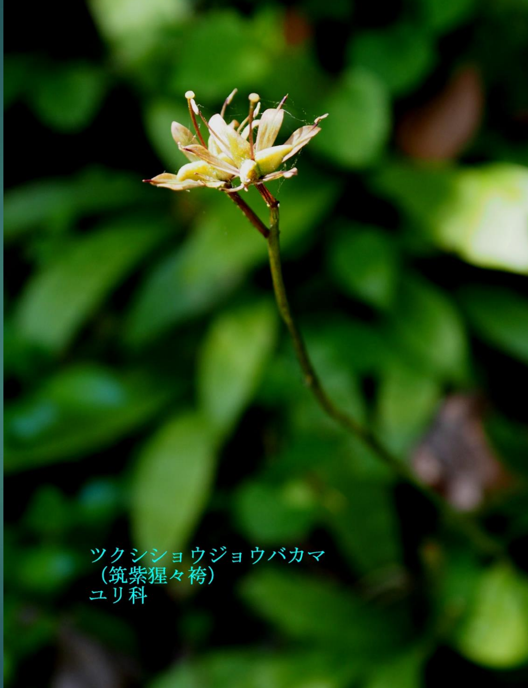
ツクシシヨウジョウバカマ (筑紫猩々袴) ユリ科