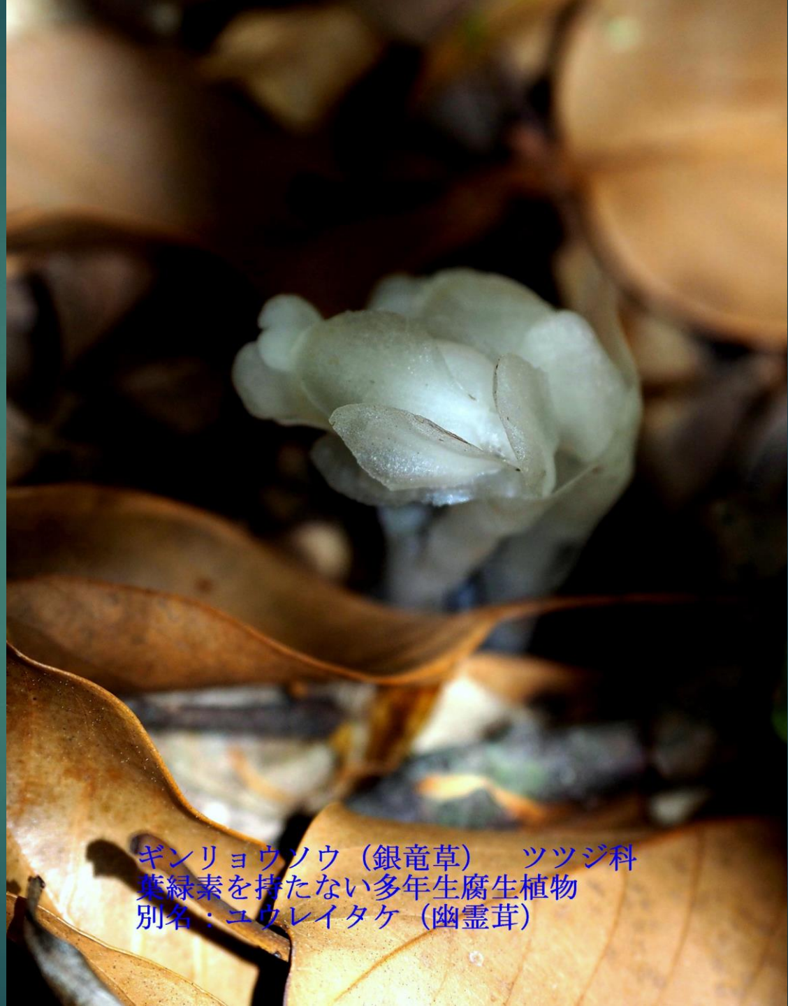
ギンリョウソウ（銀竜草） ツツジ科 葉緑素を持たない多年生腐生植物 別名：ユウレイタケ（幽霊茸）