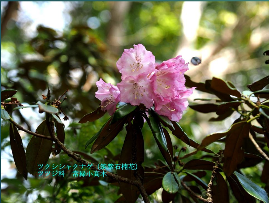
ツクシシャクナゲ (筑紫石楠花) ツツジ科 常緑小高木