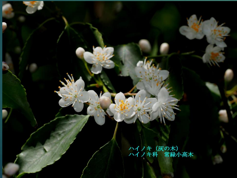
ハイノキ (灰の木) ハイノキ科 常緑小高木