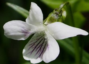
ツボスミレ (坪菫) スミレ科 別名：ニョイスミレ (如意菫)