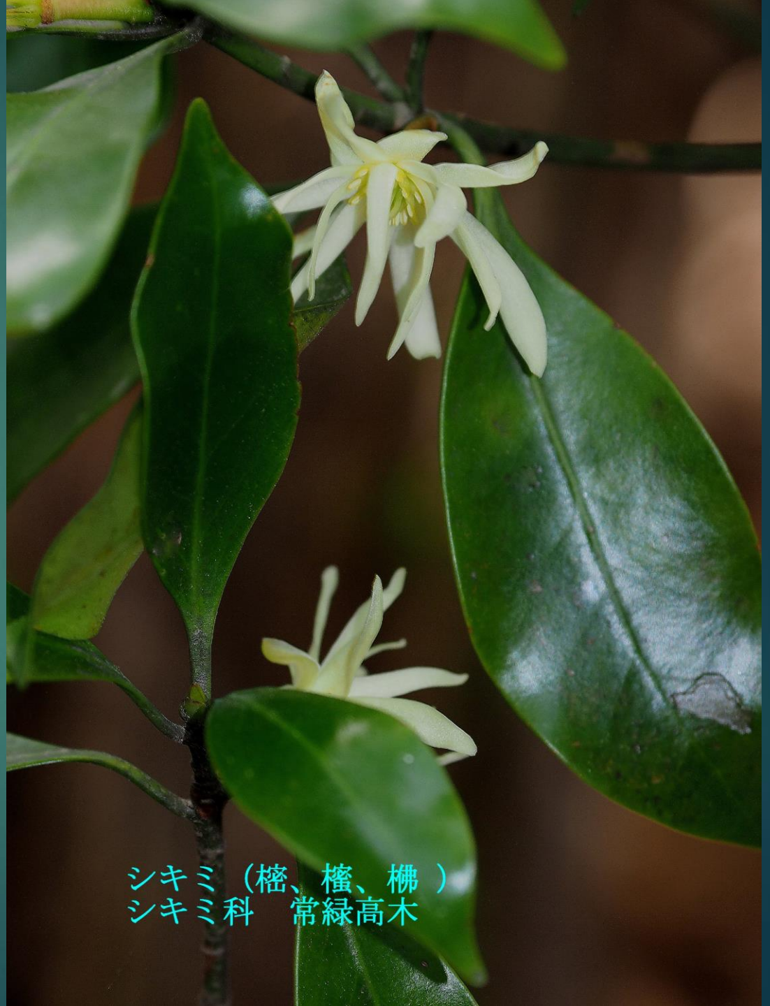
シキミ (檜、檜、榎) シキミ科 常緑高木