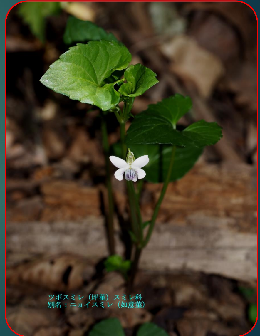
ツボスミレ（俘堇）スミレ科 別名：ニョイスミレ（如意堇）