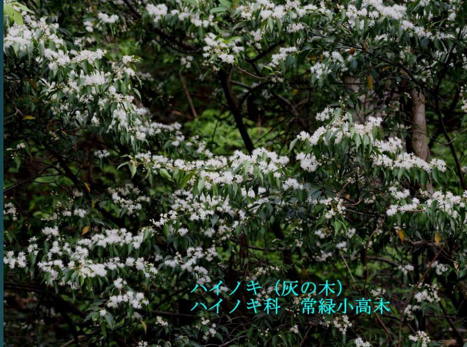
ハイノキ (灰の木) ハイノキ科 常緑小高木