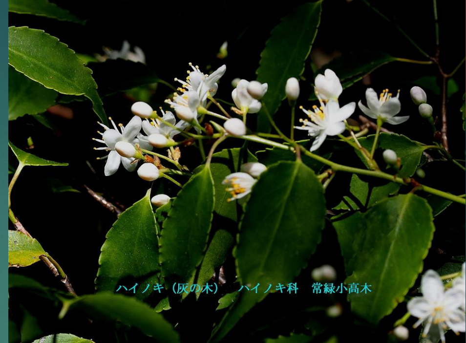
ハイノキ (灰の木) ハイノキ科 常緑小高木