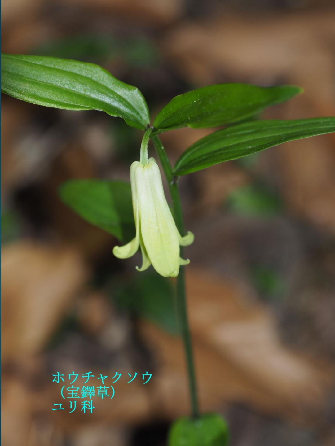
ホウチャクソウ (宝鐸草) ユリ科