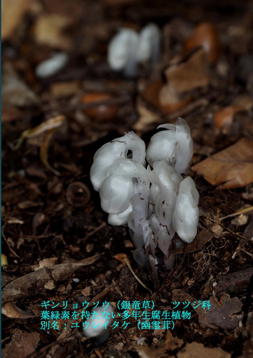
ギンリョウソウ（銀竜草） ツツジ科 葉緑素を持たない多年生腐生植物 別名：ユウレイタケ（幽霊茸）