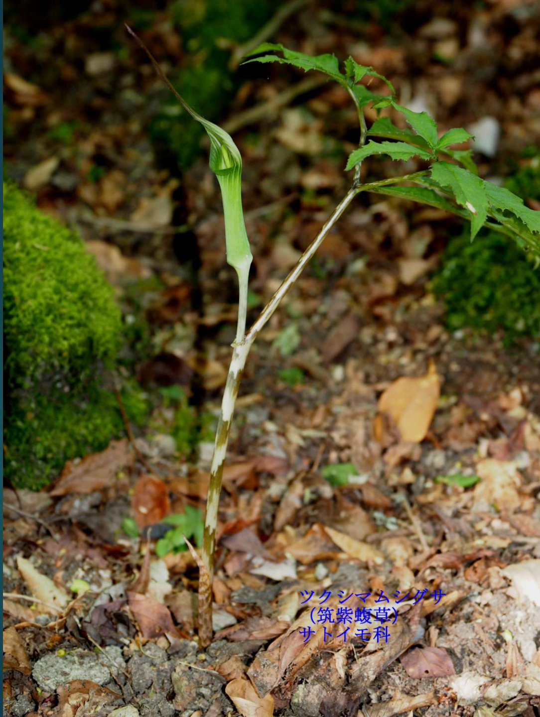
ツクシマムシグサ (筑紫蝮草) サトイモ科