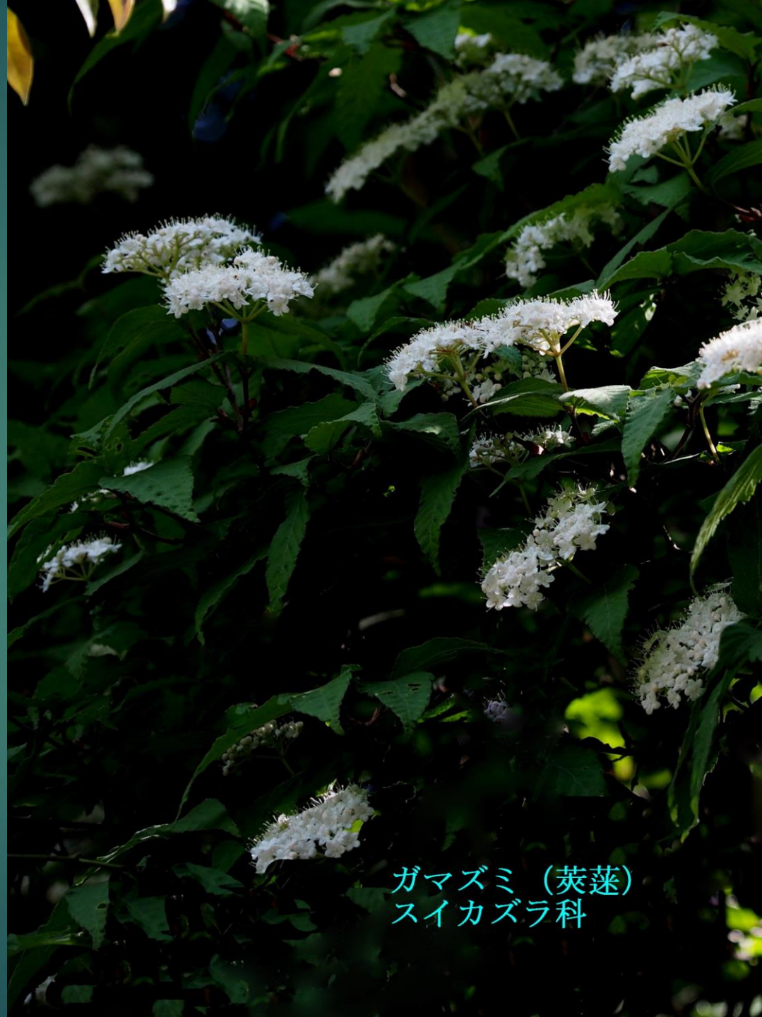
ガマズミ (莢蒾) スイカズラ科