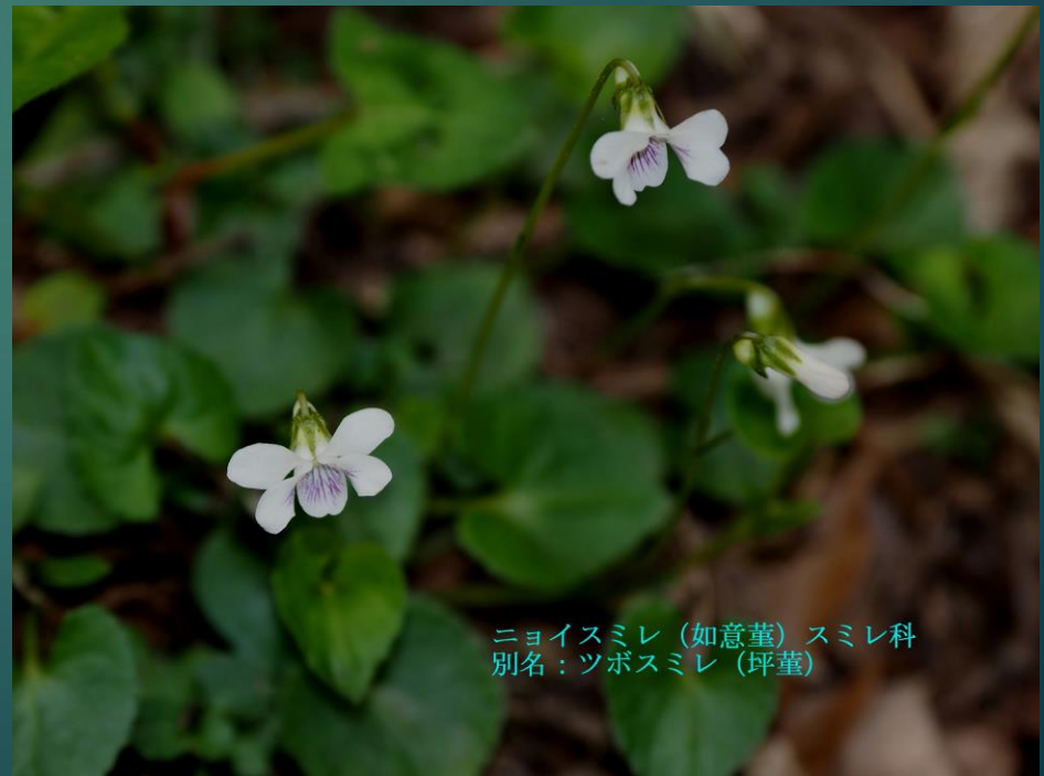
ニョイスミレ (如意堇) スミレ科 別名：ツボスミレ (坪堇)