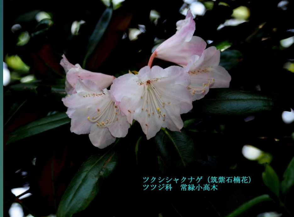
ツクシシャクナゲ (筑紫石楠花) ツツジ科 常緑小高木