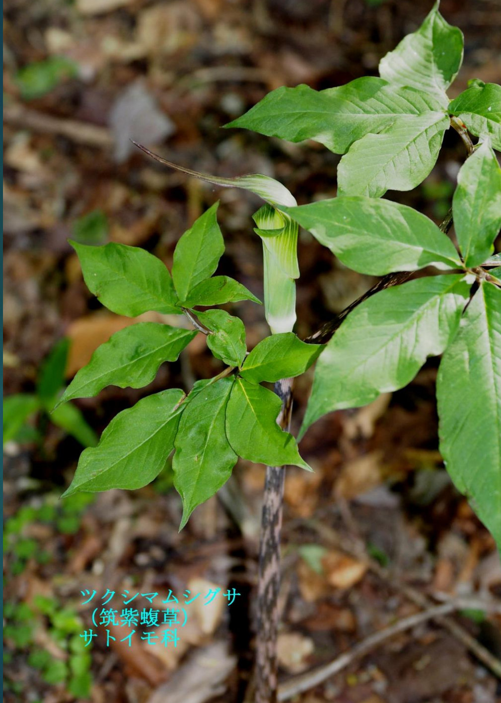
ツクシマムシグサ (筑紫蝮草) サトイモ科