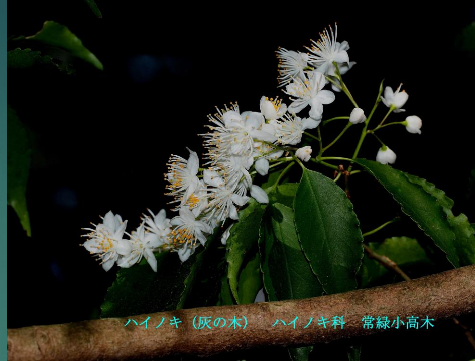
ハイノキ (灰の木) ハイノキ科 常緑小高木