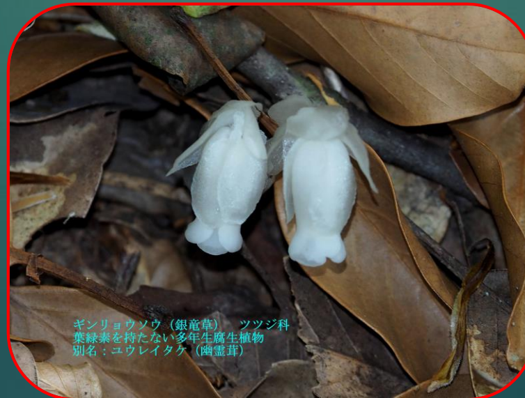
ギンリョウソウ（銀竜草） ツツジ科 葉緑素を持たない多年生腐生植物 別名：ユウレイタケ（幽霊茸）