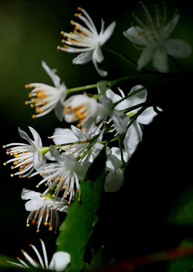
ハイノキ (灰の木) ハイノキ科 常緑小高木