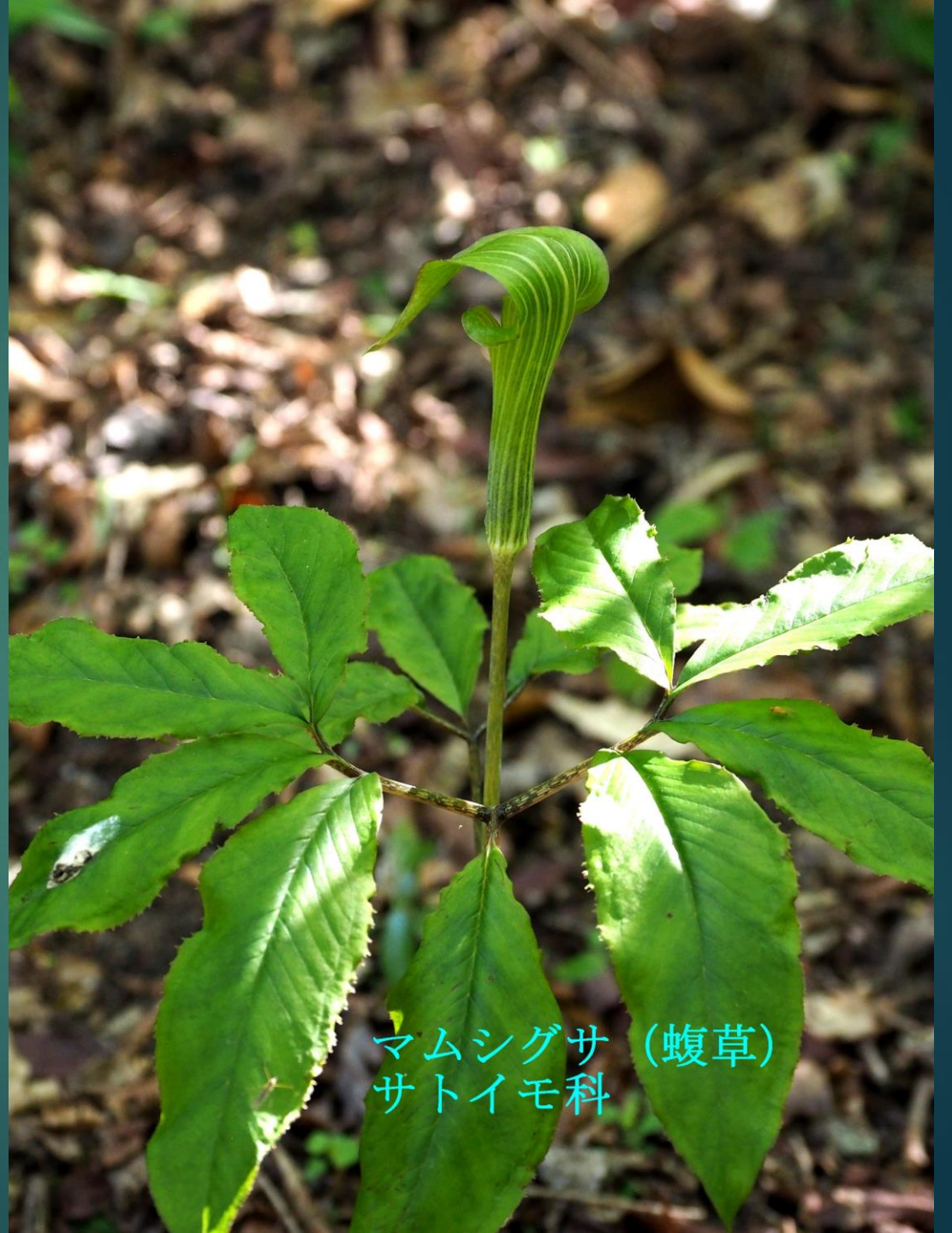
マムシグサ (蝮草) サトイモ科