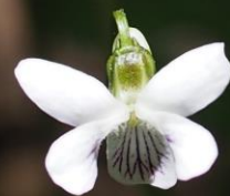
ツボスミレ (坪菫) スミレ科 別名：ニョイスミレ (如意菫)