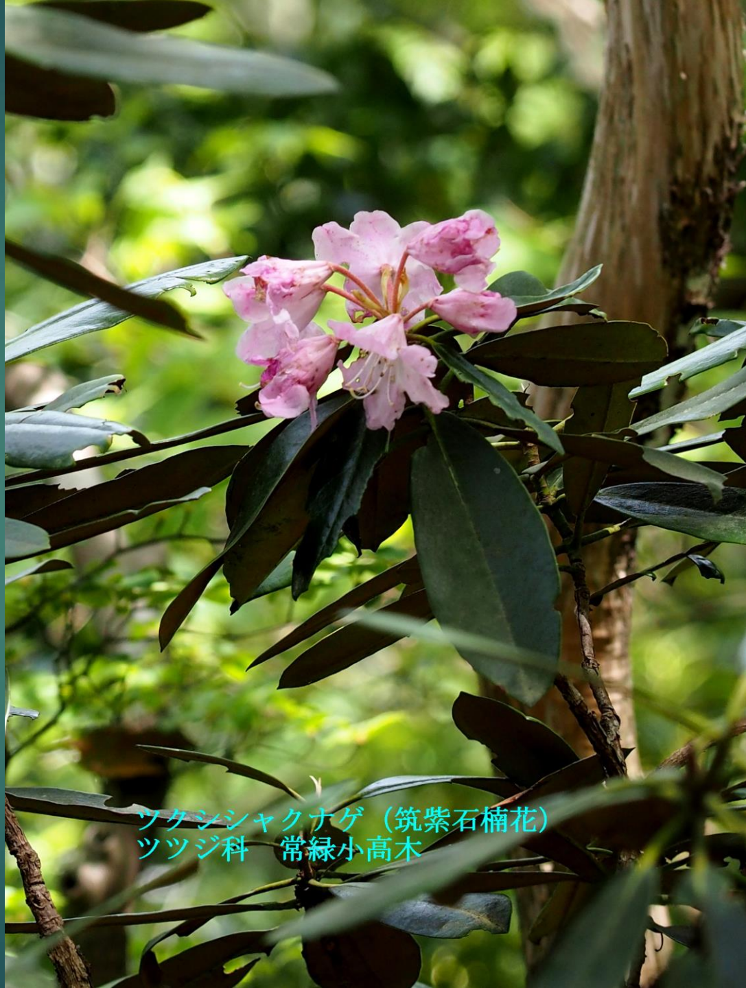
ツクシシャクナゲ (筑紫石楠花) ツツジ科 常緑小高木