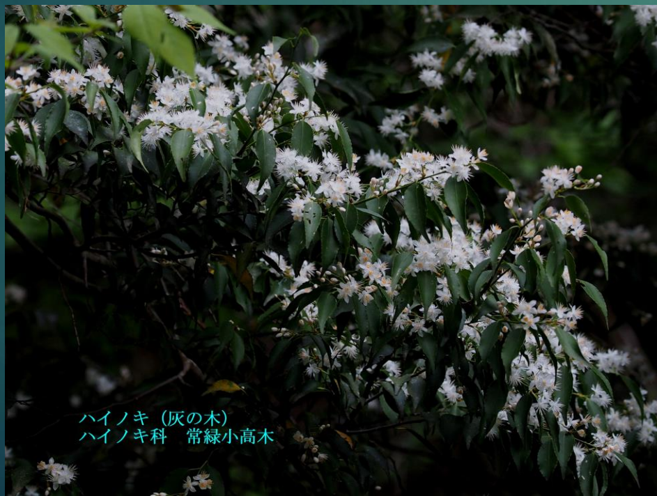
ハイノキ (灰の木) ハイノキ科 常緑小高木