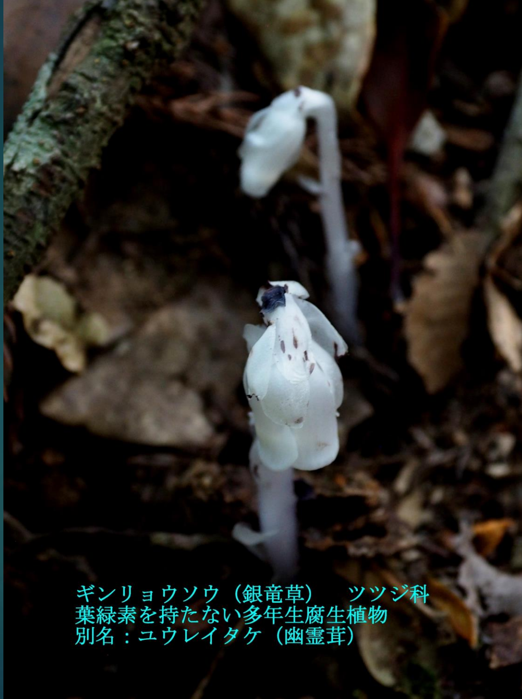
ギンリョウソウ (銀竜草) ツツジ科 葉緑素を持たない多年生腐生植物 別名：ユウレイタケ (幽霊茸)