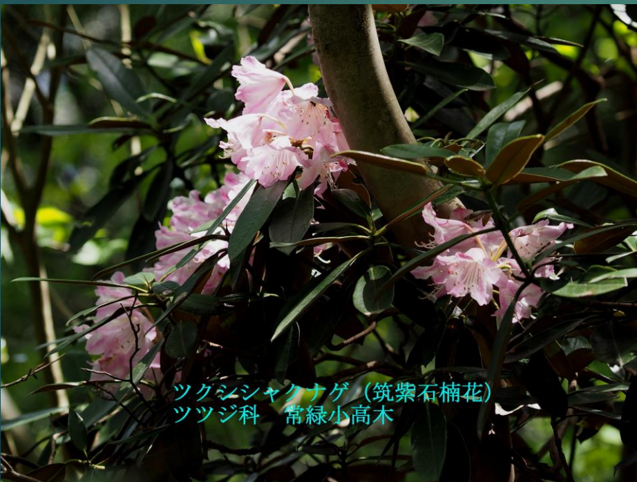
ツクシシャクナゲ (筑紫石楠花) ツツジ科 常緑小高木