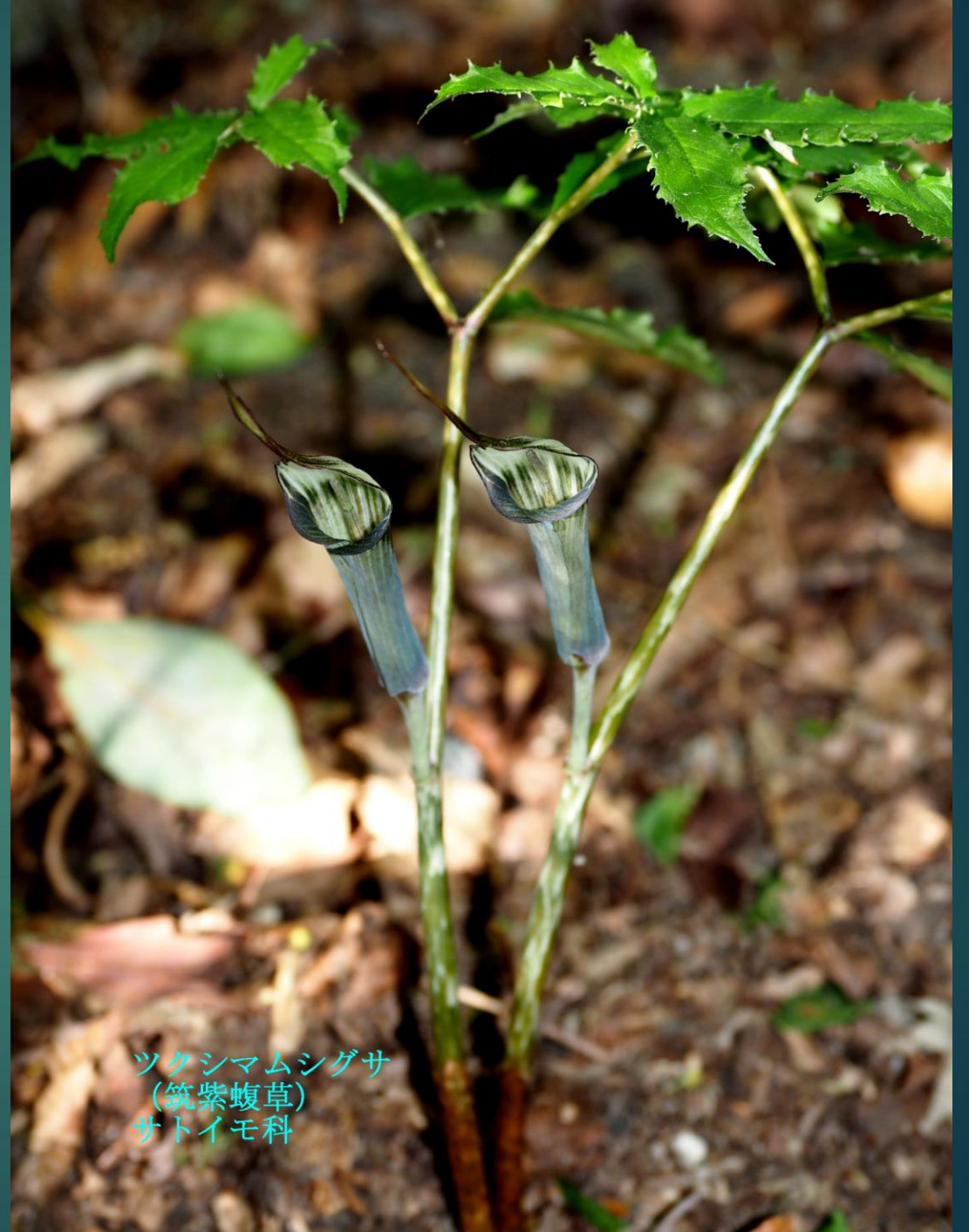
ツクシマムシグサ (筑紫蝮草) サトイモ科