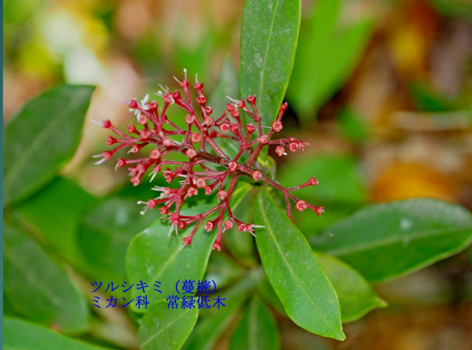
ミカン科 常緑低木 ツルシキミ (蔓櫛)