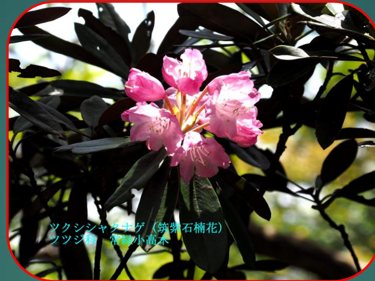
ツクシシャクナゲ（筑紫石楠花） ツツジ科 常緑小高木