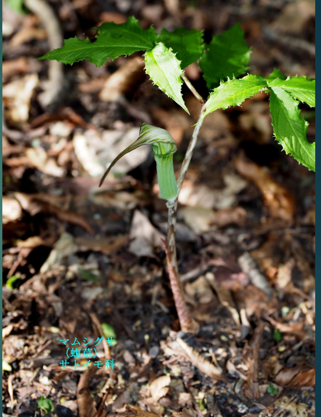
マムシグサ (蝮草) サトイモ科