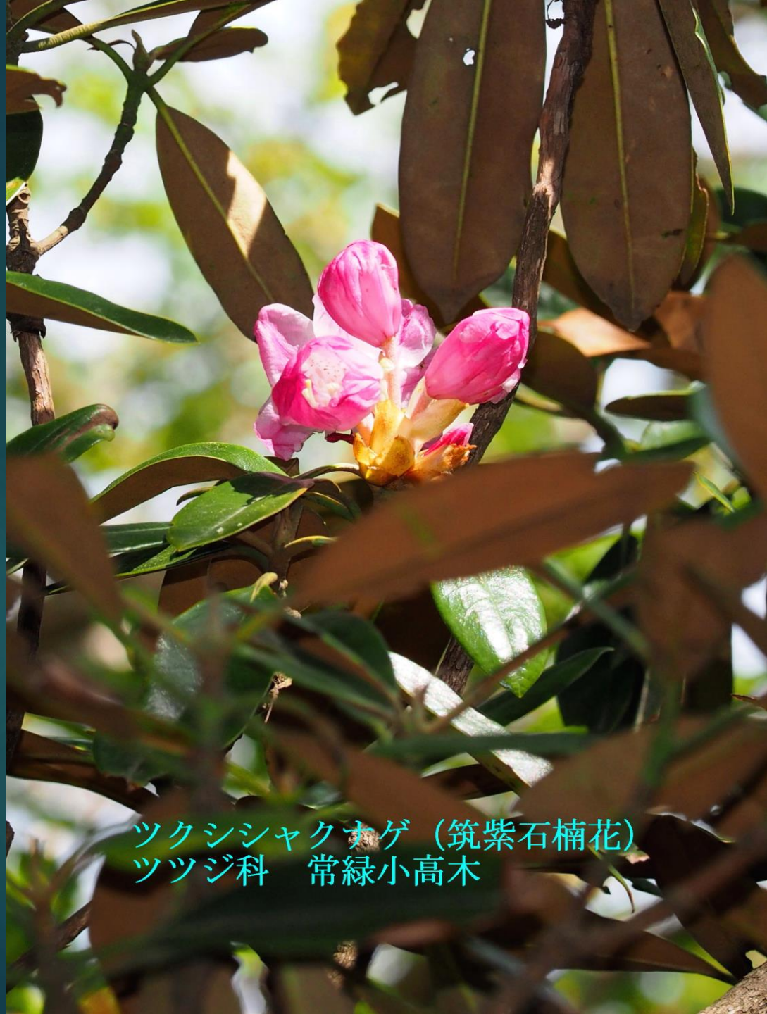
ツクシヤクオゲ (筑紫石楠花) ツツジ科 常緑小高木