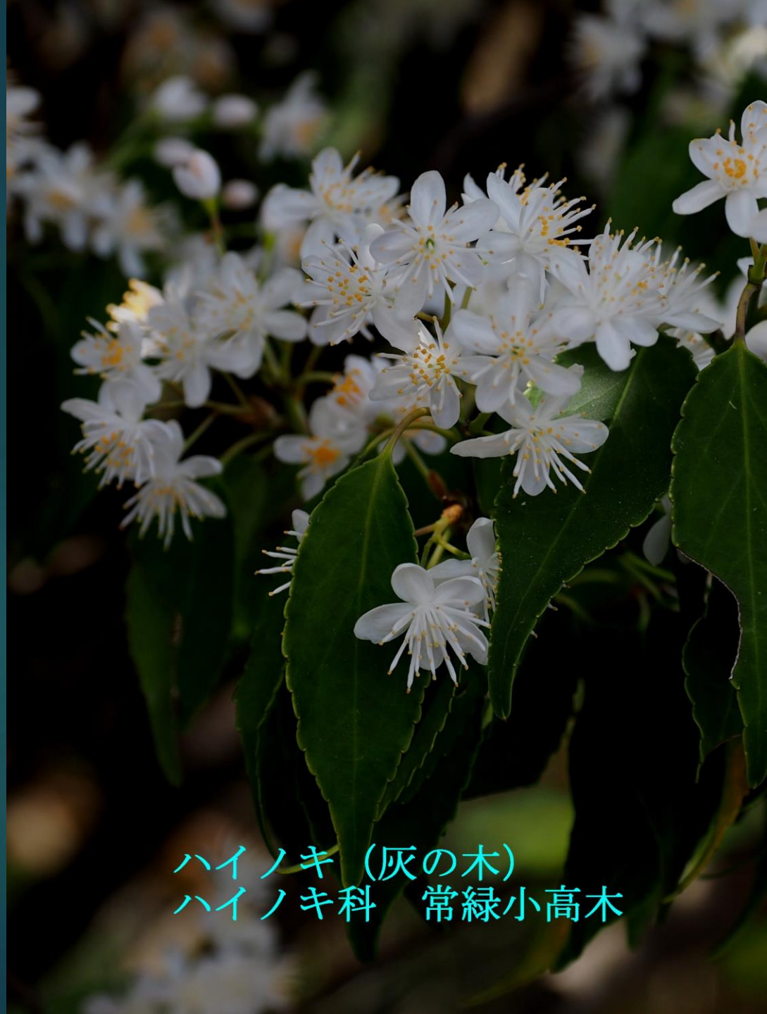
ハイノキ (灰の木) ハイノキ科 常緑小高木