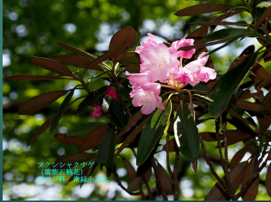
ツクシシャクナゲ (筑紫石楠花) ツツジ科 常緑小高木