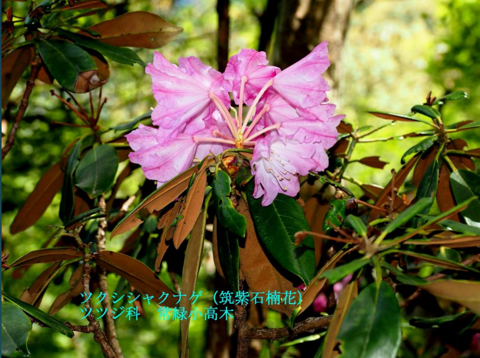
ツクシシャクナゲ (筑紫石楠花) ツツジ科 常緑小高木