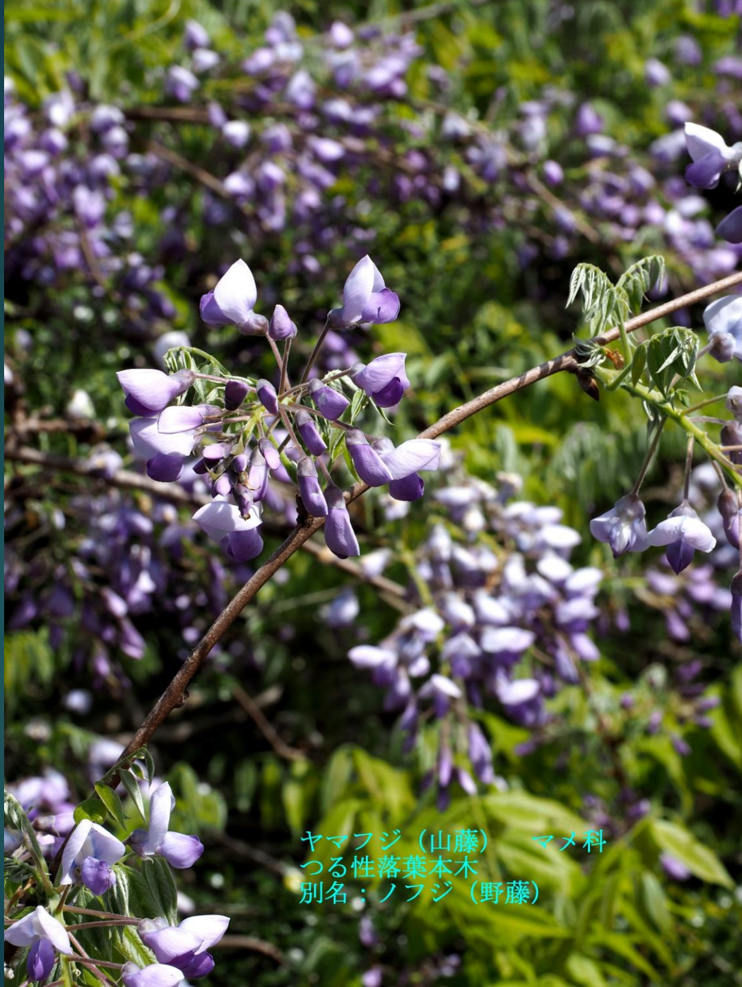
ヤマフジ (山藤) マメ科 つる性落葉本木 別名：ノフジ (野藤)