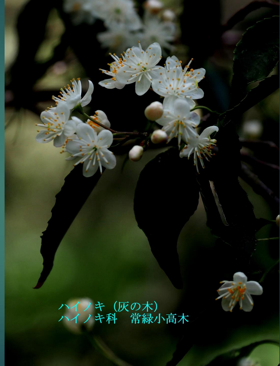
ハイノキ (灰の木) ハイノキ科 常緑小高木