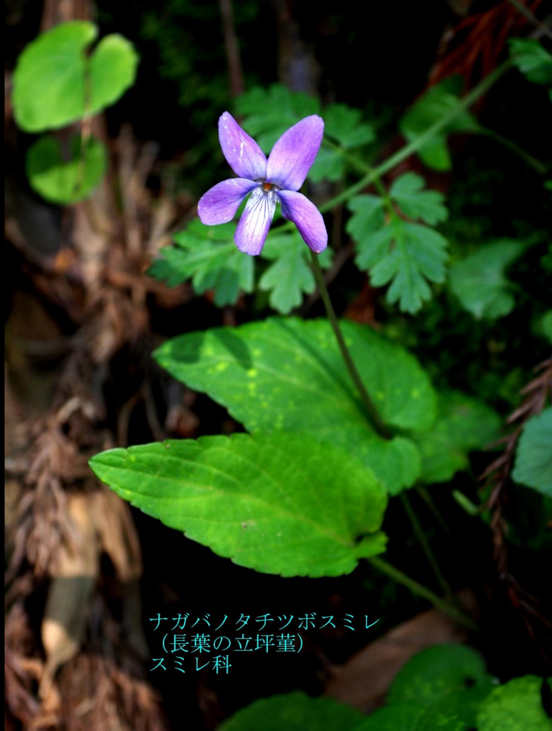
ナガバノタチツボスミレ (長葉の立坪堇) スミレ科