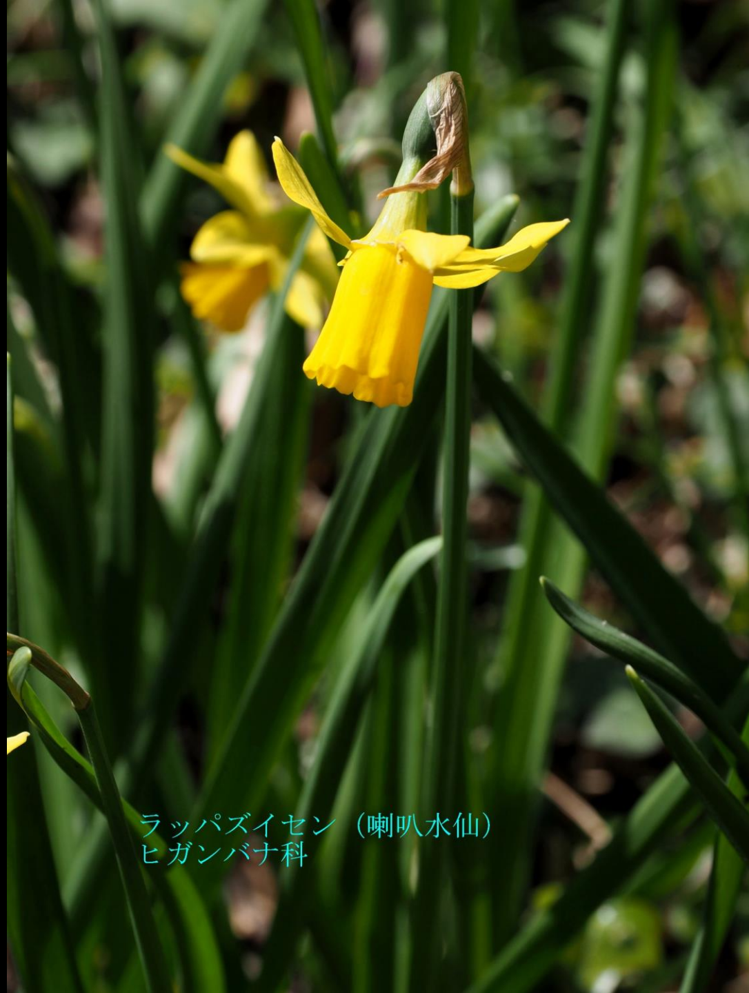
ラップズイセン (喇叭水仙) ヒガンバナ科