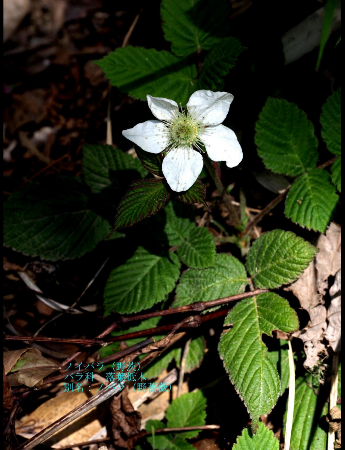
ノイバラ (野茨) バラ科 落葉低木 別名: ノバラ (野薔薇)