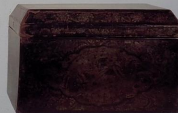
孔雀文沈金經箱 (国指定重要文化財)