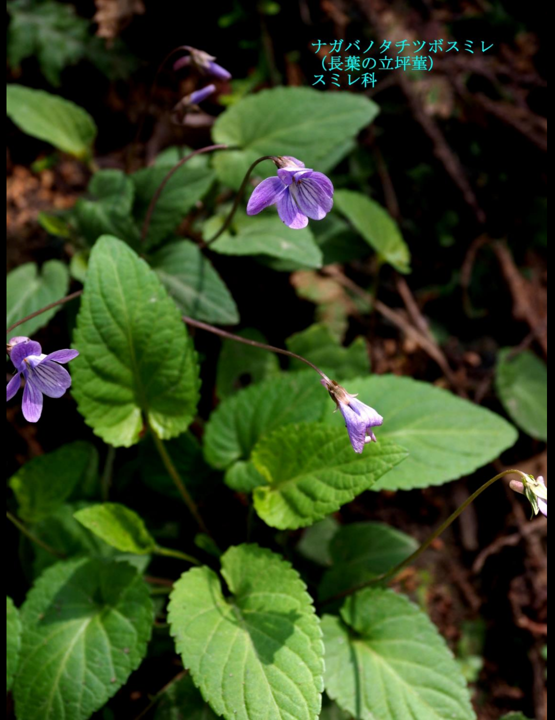
ナガバナタチツボスミレ (長葉の立坪堇) スミレ科