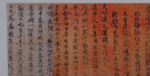
誓願寺孟蘭盆縁起 Seiganji Urabon Engi (History of Seiganji Bon Festival) 誓愿寺孟兰盆缘起 세이간지 무란반경기

According to the temple records, Seiganji Temple was founded in 1175 at the prayers of a daughter from the Nakahara family, a powerful clan in Itoshima, and the memorial service held to commemorate its completion was presided over by Yosai, the founder of Zen. Yosai then wrote "Seiganji Urabon Engi" (A History of the Seiganji Bon Festival). This is thought to be the only extant document written in Yosai's own hand and has been designated a national treasure. Yosai went to Sung (modern-day China) in 1187 and after his return became the first person to teach Zen Buddhism in Japan.