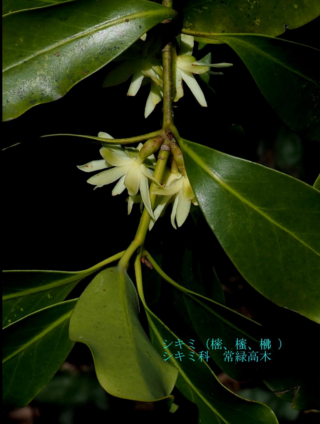
シキミ (檜、檜、榎) シキミ科 常緑高木