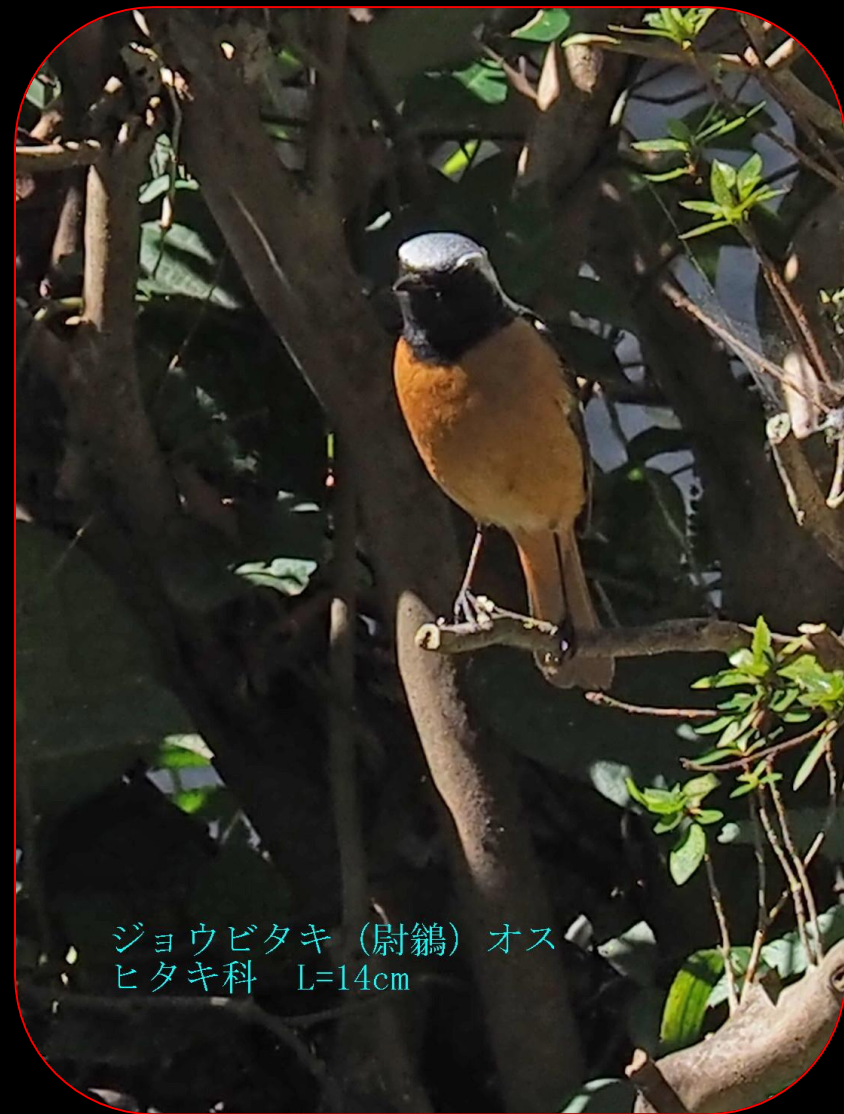
ジョウビタキ（尉鶉）オス ヒタキ科 L=14cm