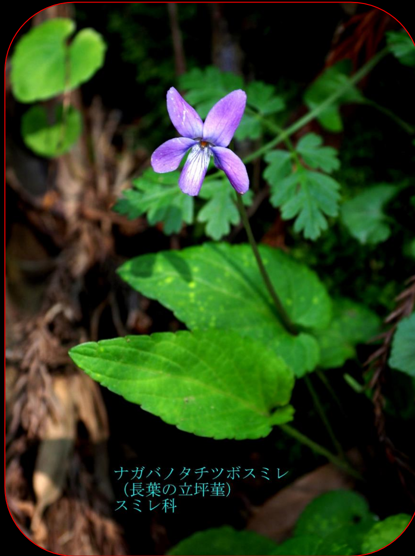
ナガバノタチツボスミレ （長葉の立坪堇） スミレ科