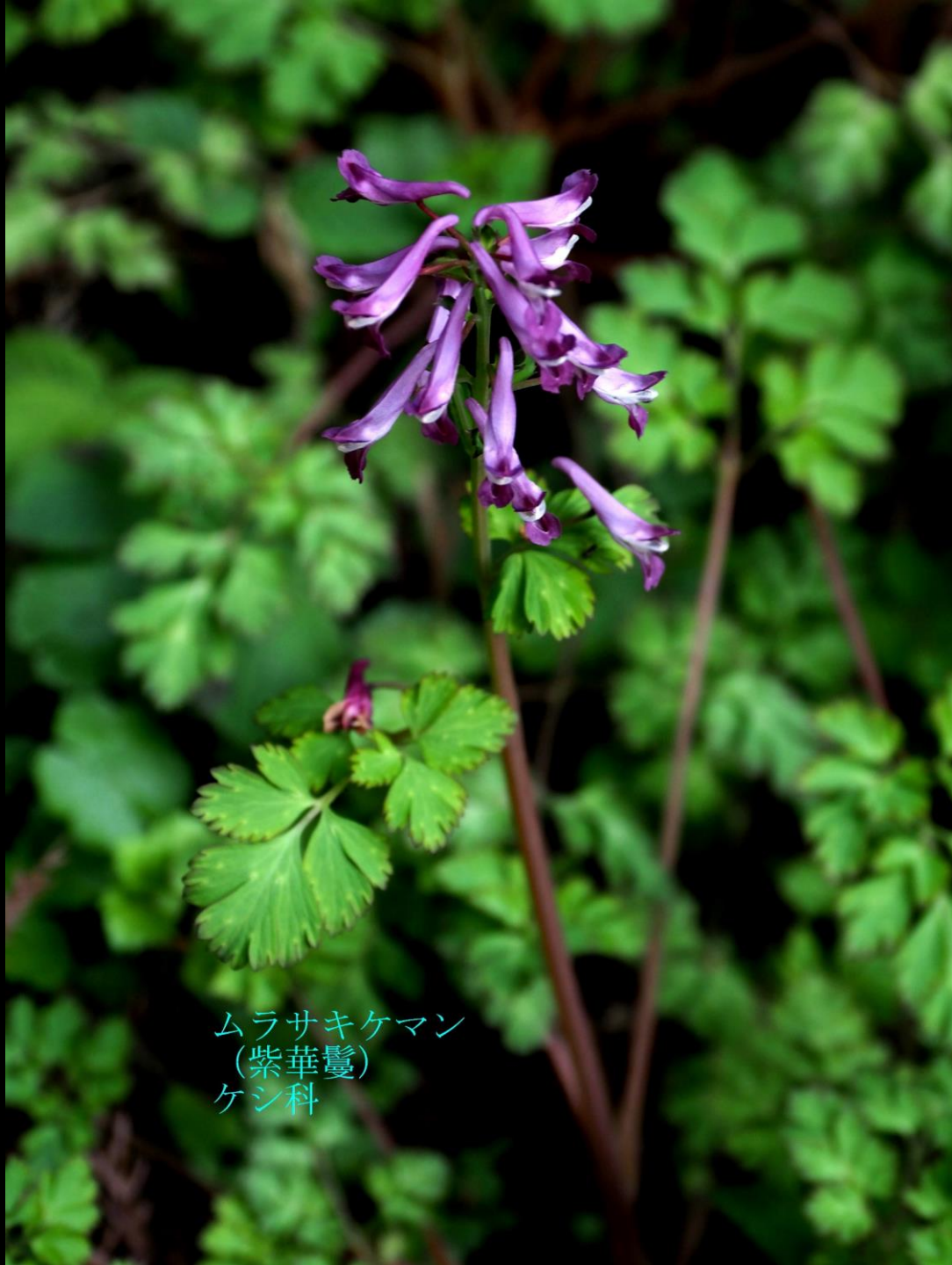
ムラサキケマン (紫華鬘) ケシ科