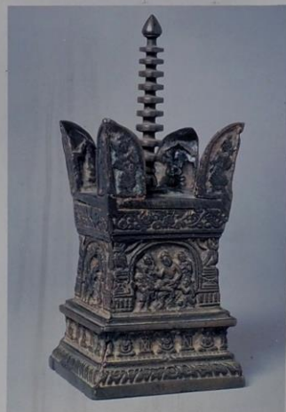
錢弘俶八万四千塔 (国指定重要文化財)