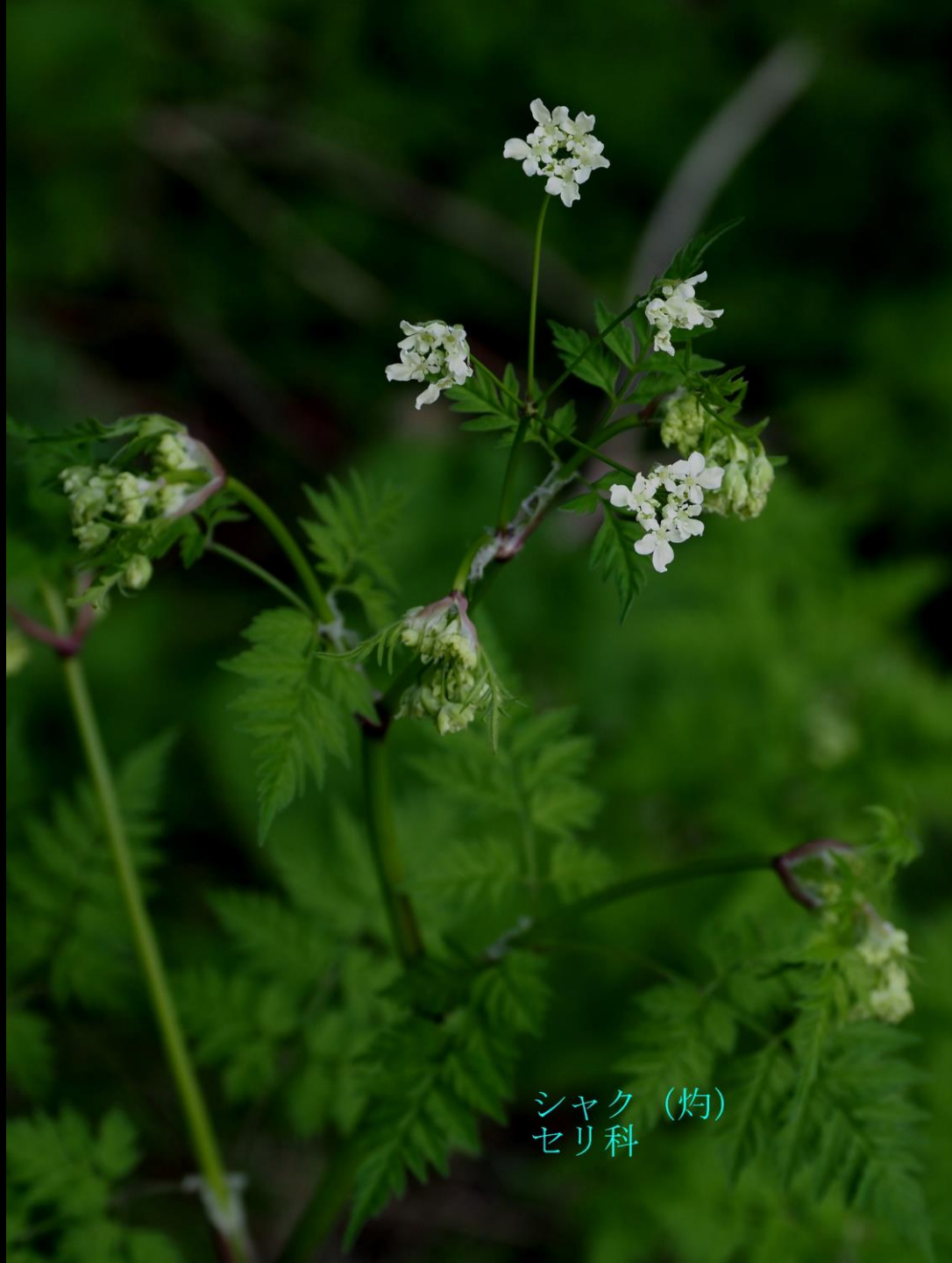
シャク (灼) セリ科