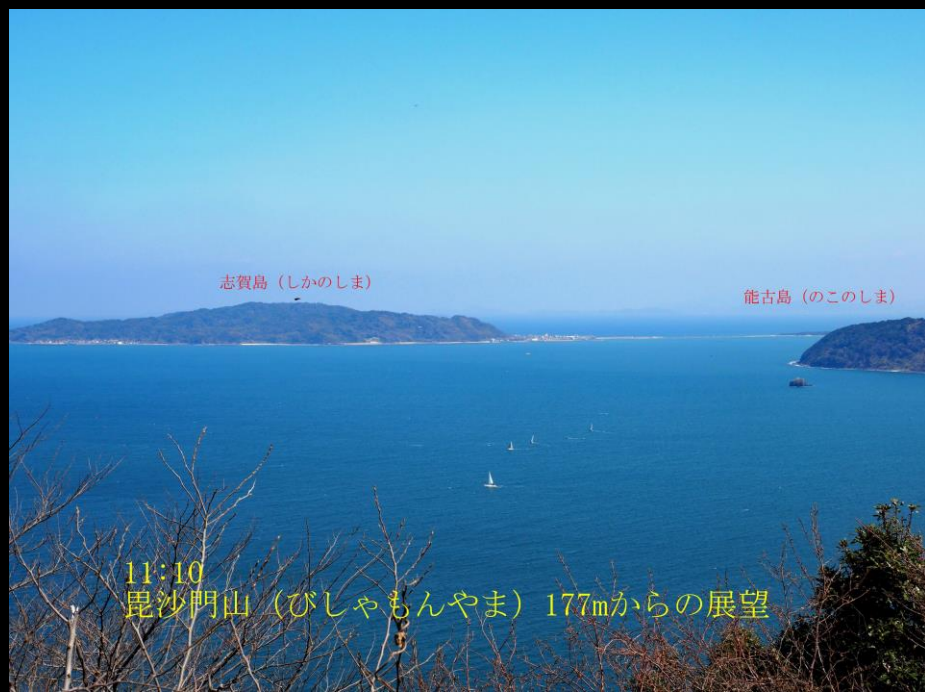
11:10 毘沙門山（びしゃもんやま）177mからの展望