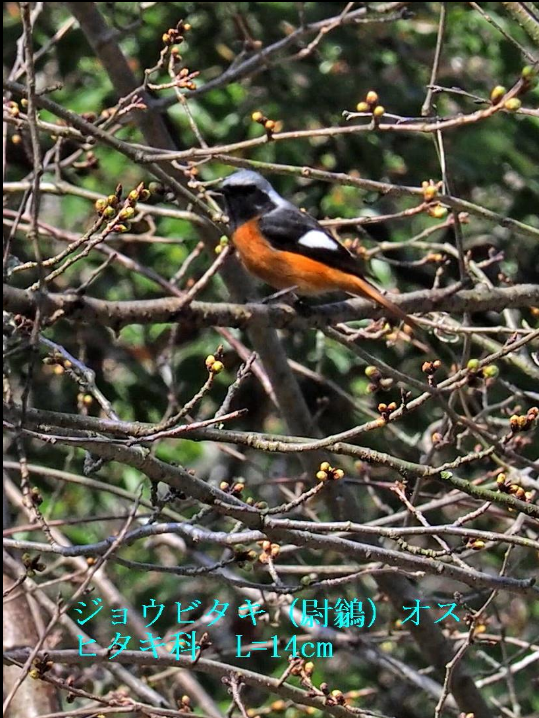
ジョウビタキ (尉鷓) オス ヒタキ科 L=14cm