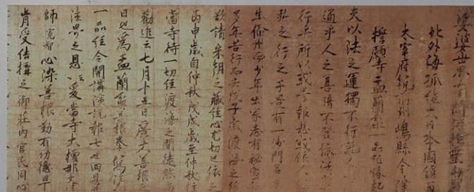
誓願寺孟蘭盆縁起 (国宝)