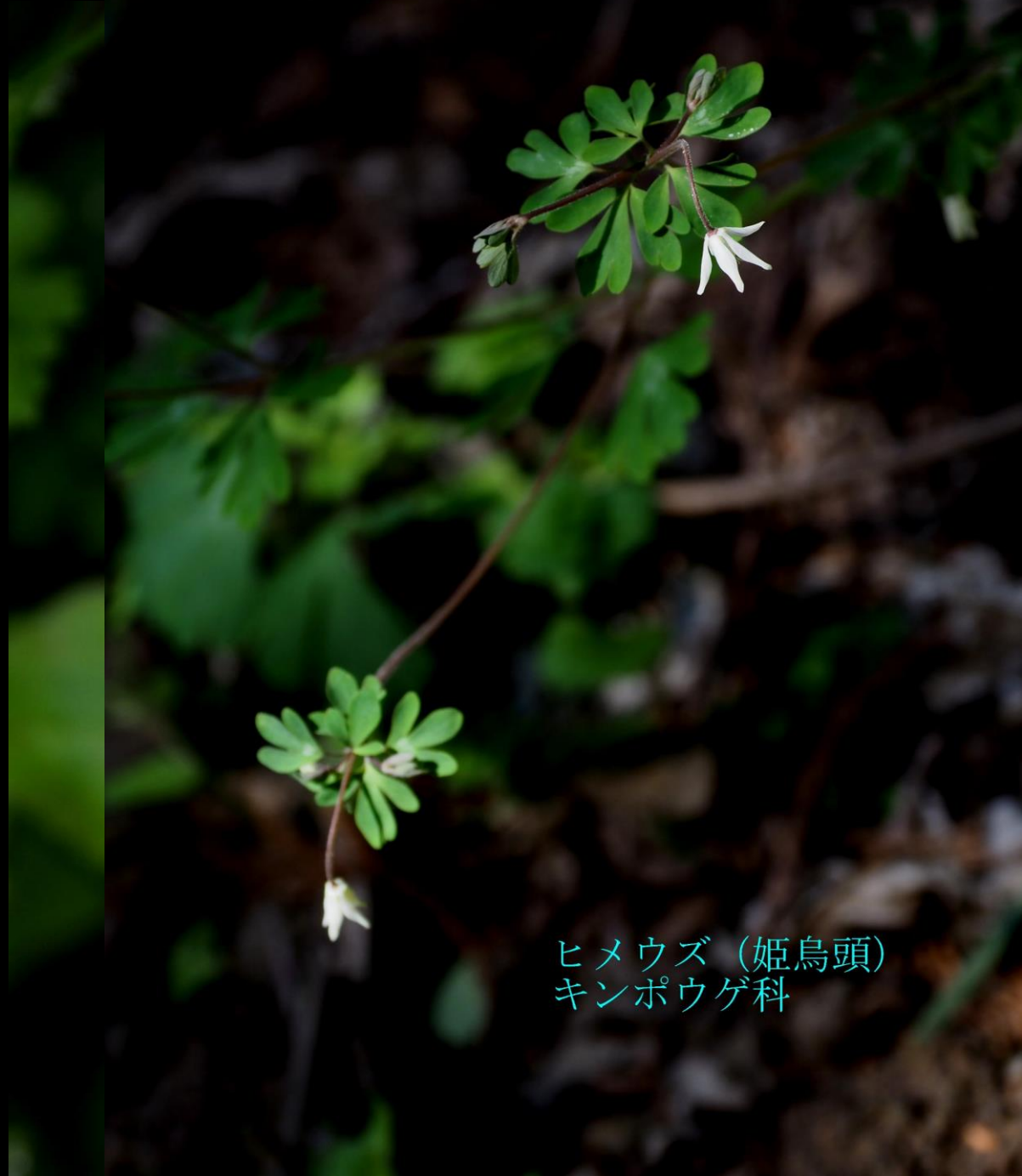
ヒメウズ（姫烏頭） キンポウゲ科