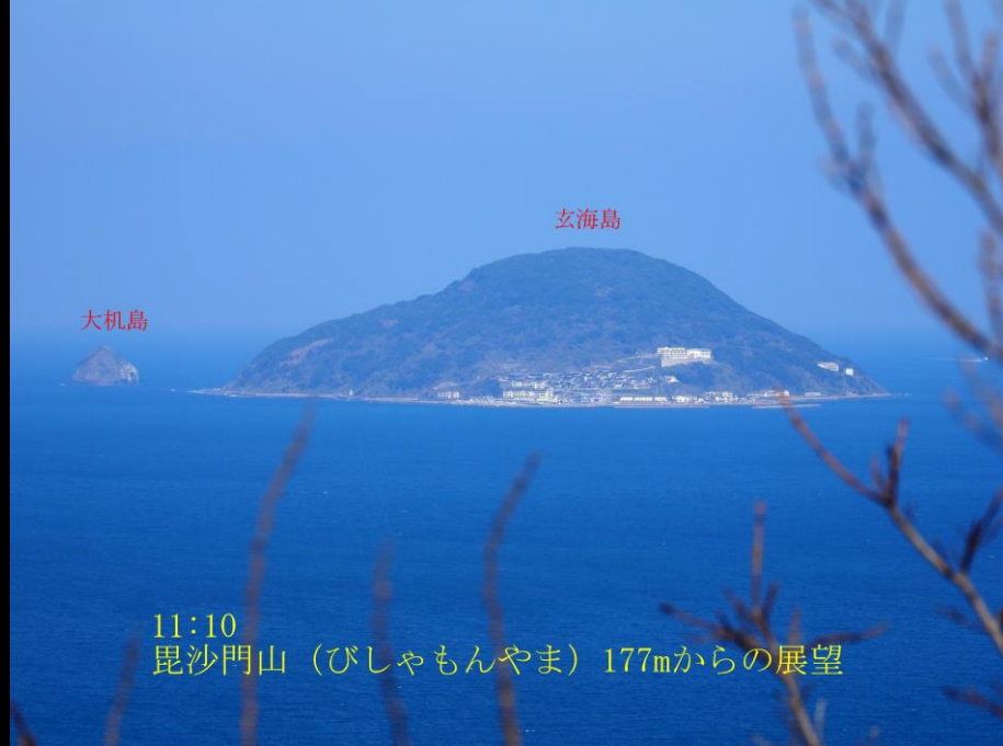
11:10 毘沙門山（びしゃもんやま）177mからの展望