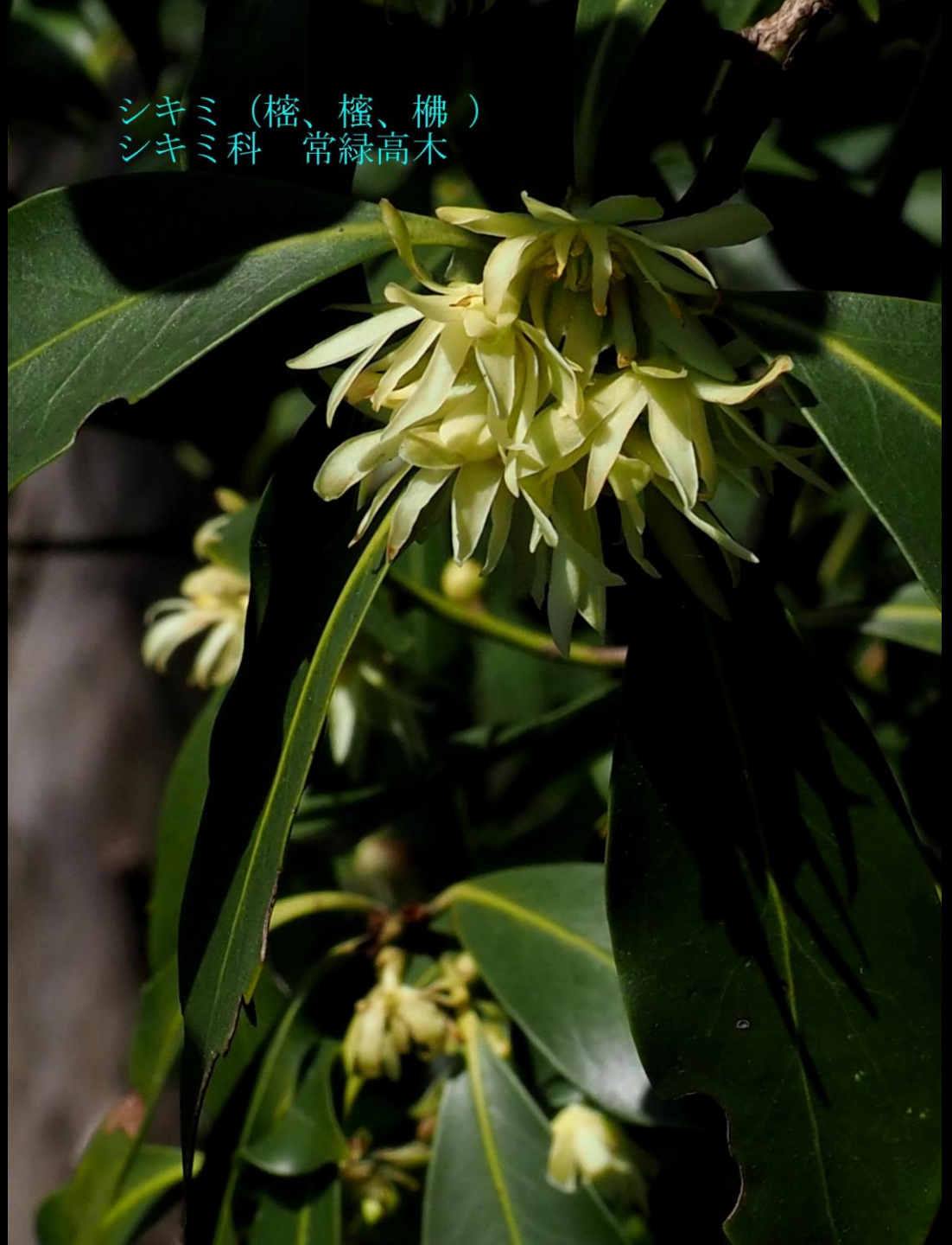
シキミ (檜、檜、榎) シキミ科 常緑高木