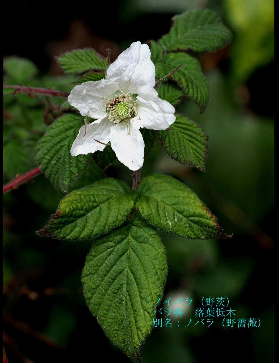
ノイバラ (野茨) バラ科 落葉低木 別名：ノバラ (野薔薇)