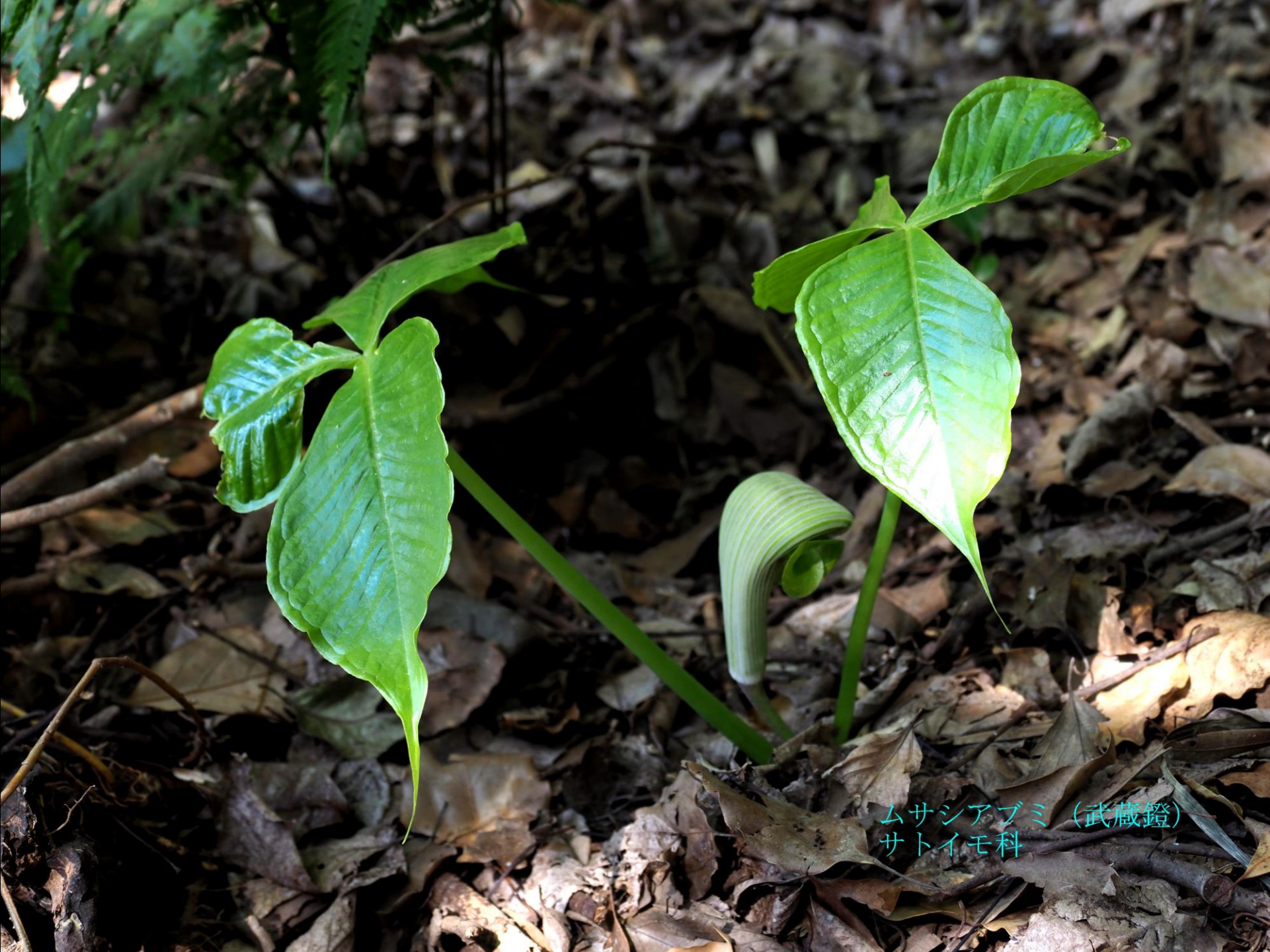
ムサシアブミ (武蔵鏡) サトイモ科