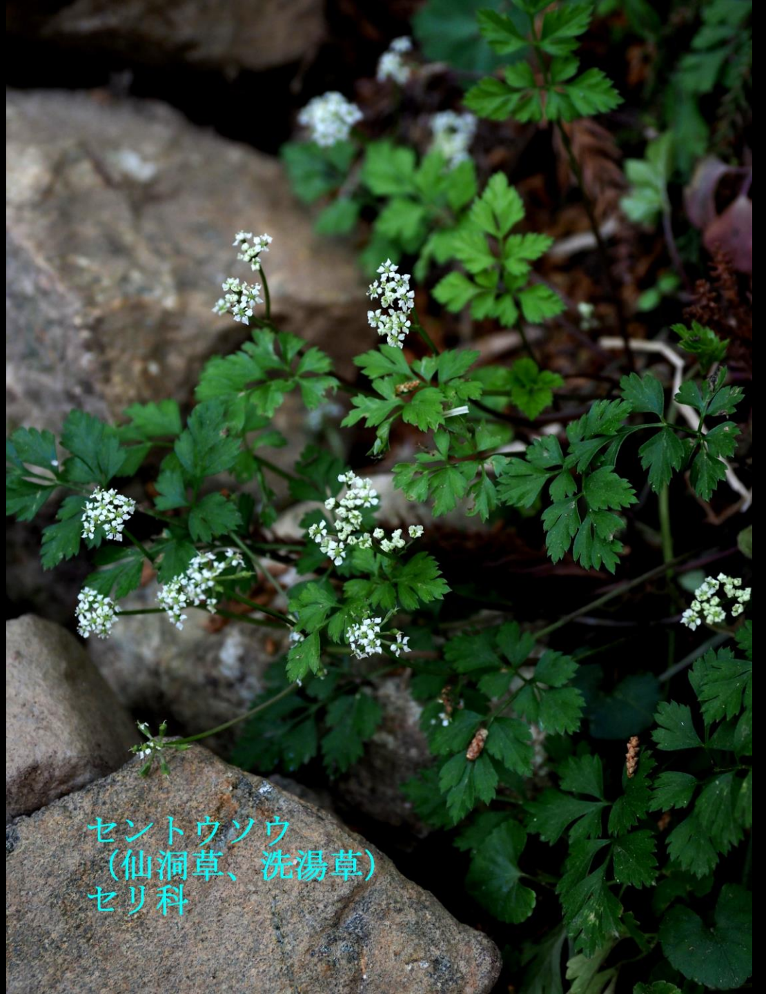
セントウソウ (仙洞草、洗湯草) セリ科