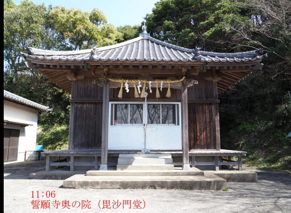
11:06 誓願寺奥の院 (毘沙門堂)