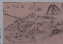
誓願寺図 Seiganji Temple (Historical Map of Seiganji Temple) 誓愿寺图 세이간지 절

据该寺的文獻记载，传说安元元年(1175年)因糸島市の豪族仲原氏的女儿许愿创建而成，为了纪念该寺的落成而进行的祭祀，是由禅宗的始祖荣西来主办的。其后，荣西执笔书写《誓愿寺孟兰盆缘起》，这本书是荣西亲笔所著的唯一作品，被指定为国宝。文治3年(1187年)，荣西去了宋(现在的中国)。回国后，在日本历史上第一次将禅宗传到日本。