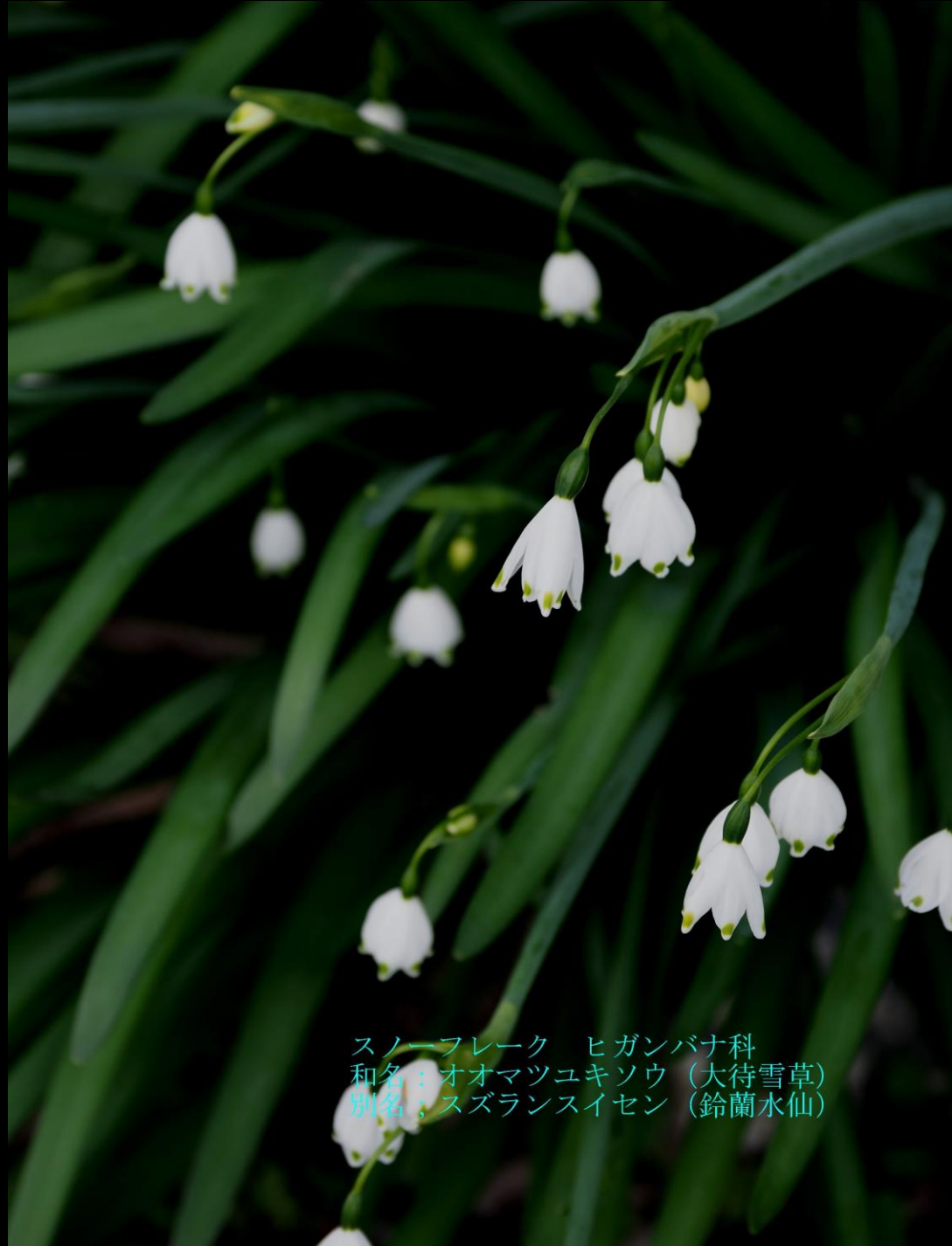
スノーフレーク ヒガンバナ科 和名：オオマツユキソウ（大待雪草） 別名：スズランスイセン（鈴蘭水仙）