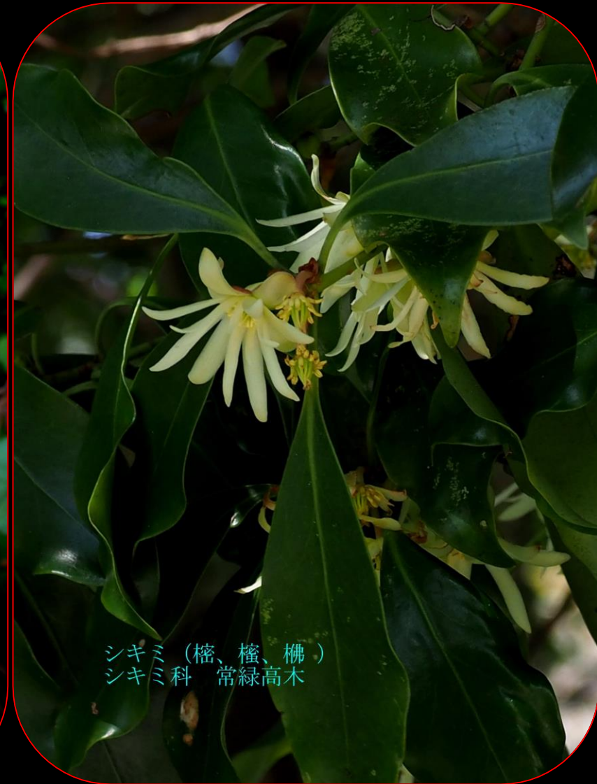
シキミ（檜、檜、榎） シキミ科 常緑高木