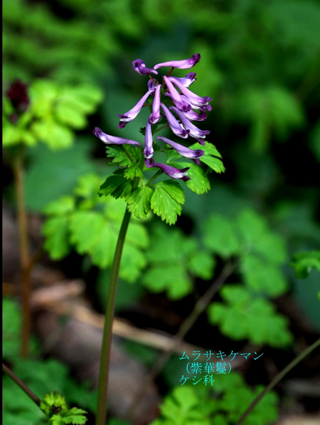
ムラサキケマン (紫華鬘) ケシ科