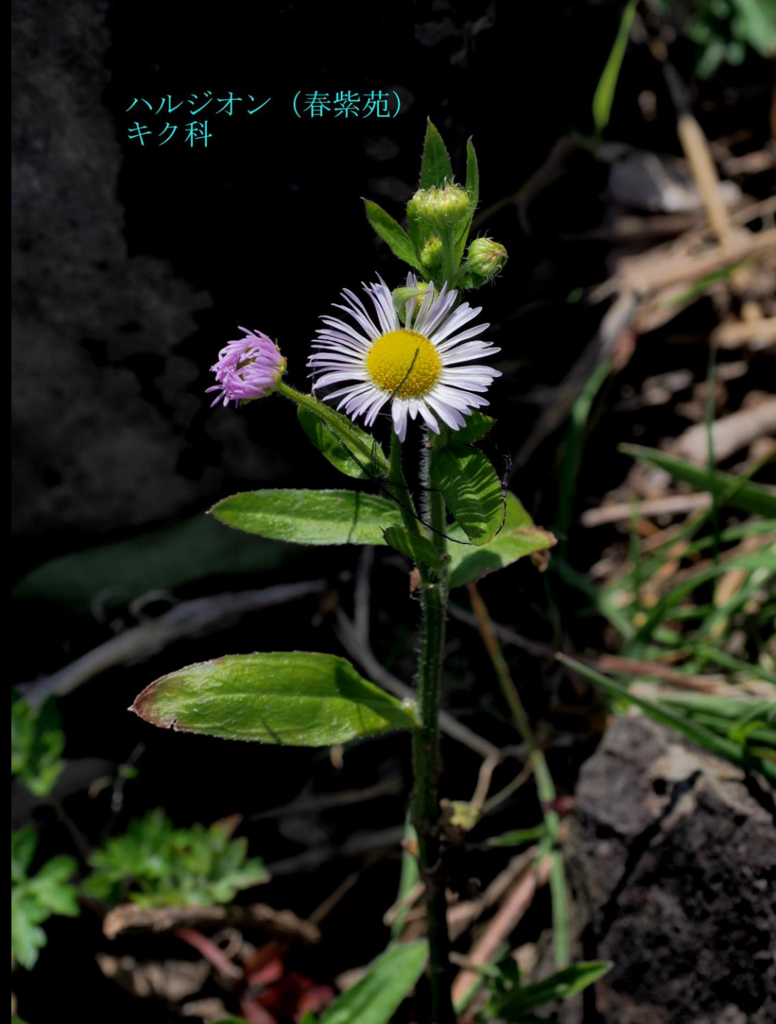
ハルジオン (春紫苑) キク科