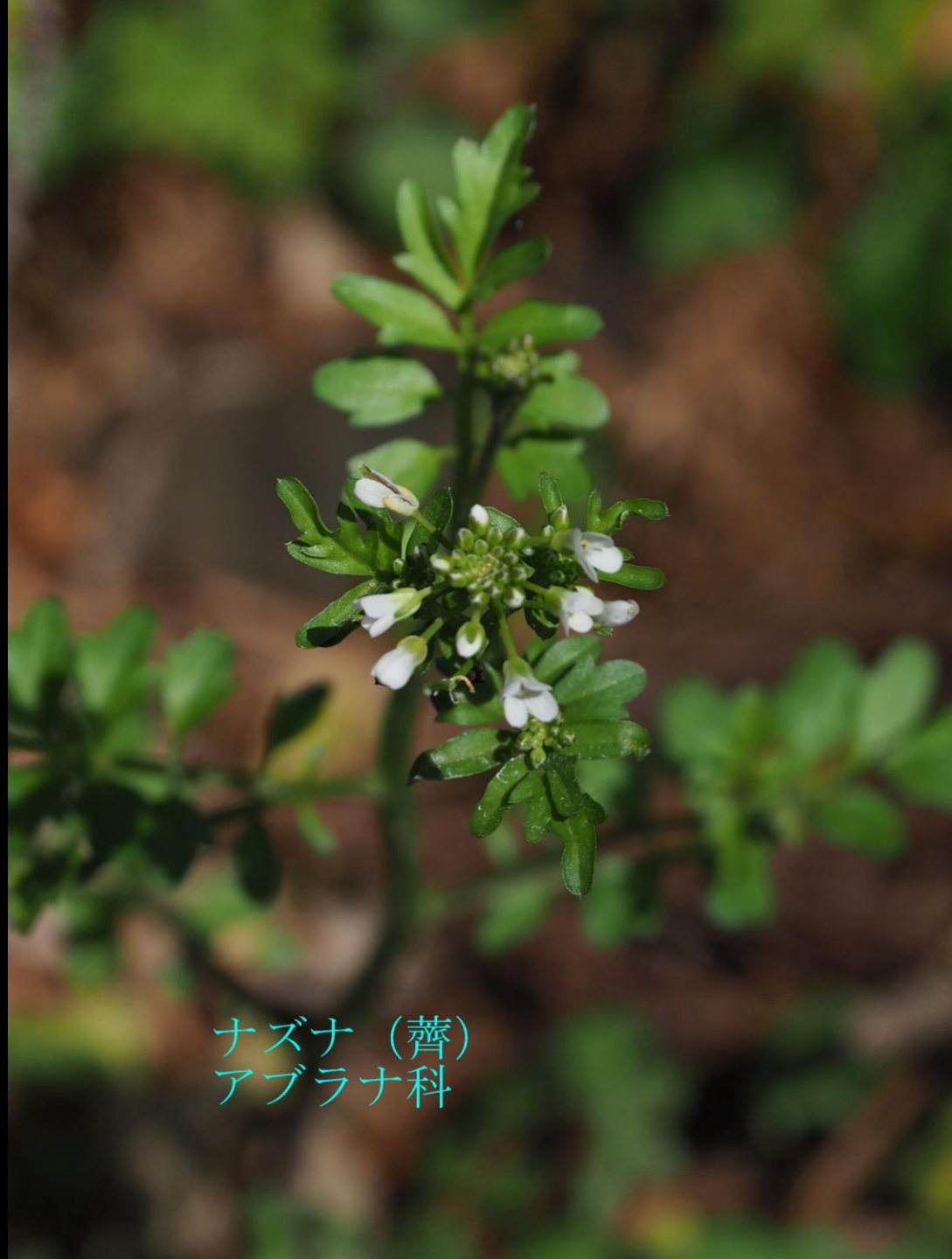
ナズナ (薺) アブラナ科