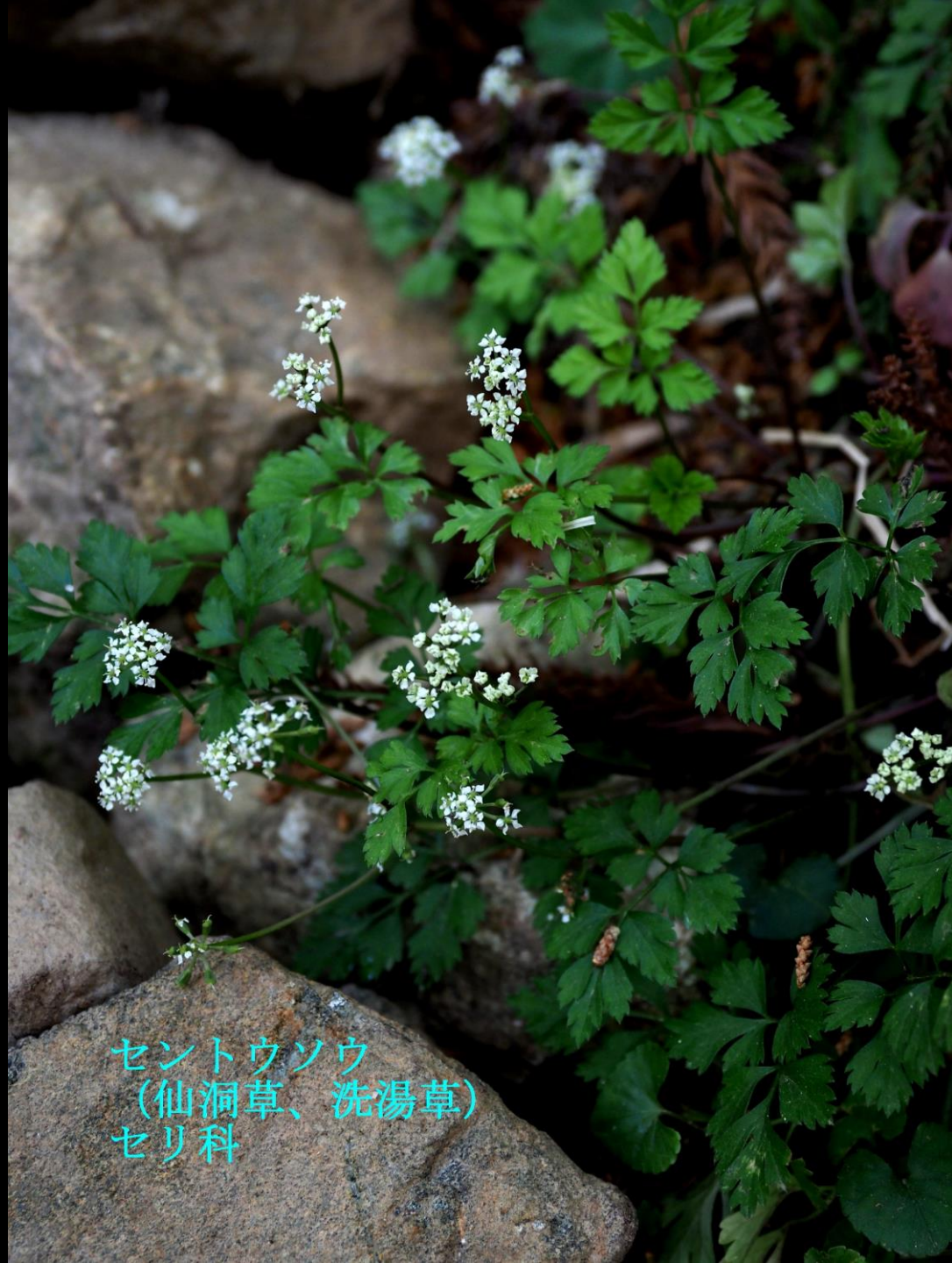
セントウソウ (仙洞草、洗湯草) セリ科