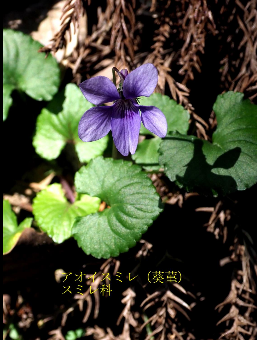
アオイスミレ (葵堇) スミレ科