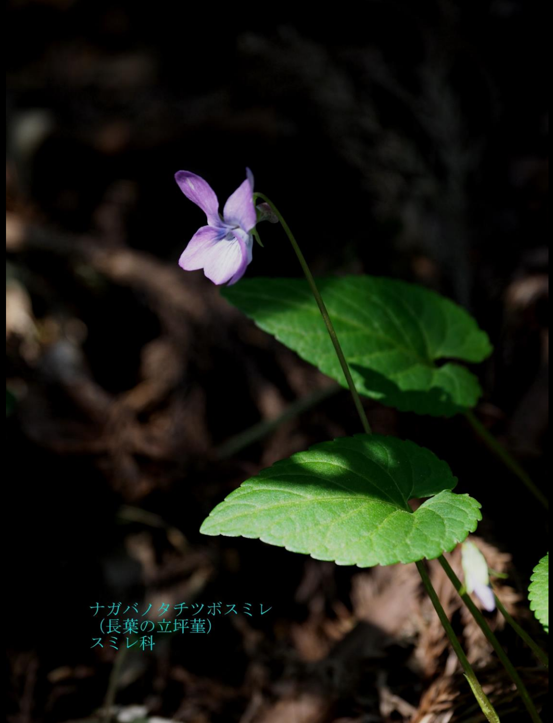
ナガバノタチツボスマイレ (長葉の立坪堇) スマイレ科