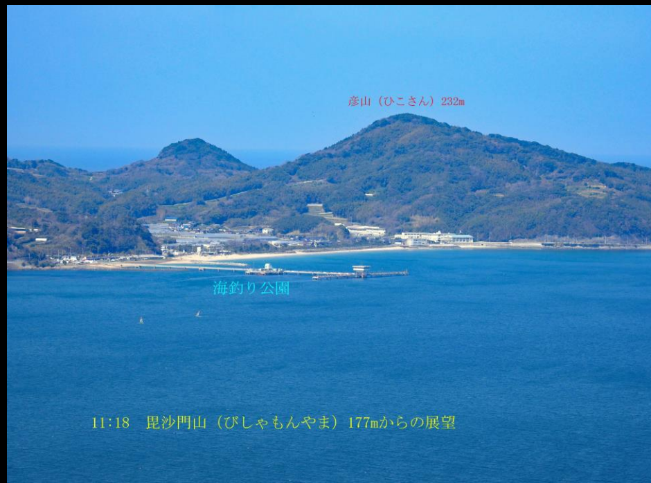
11:18 毘沙門山（びしゃもんやま）177mからの展望