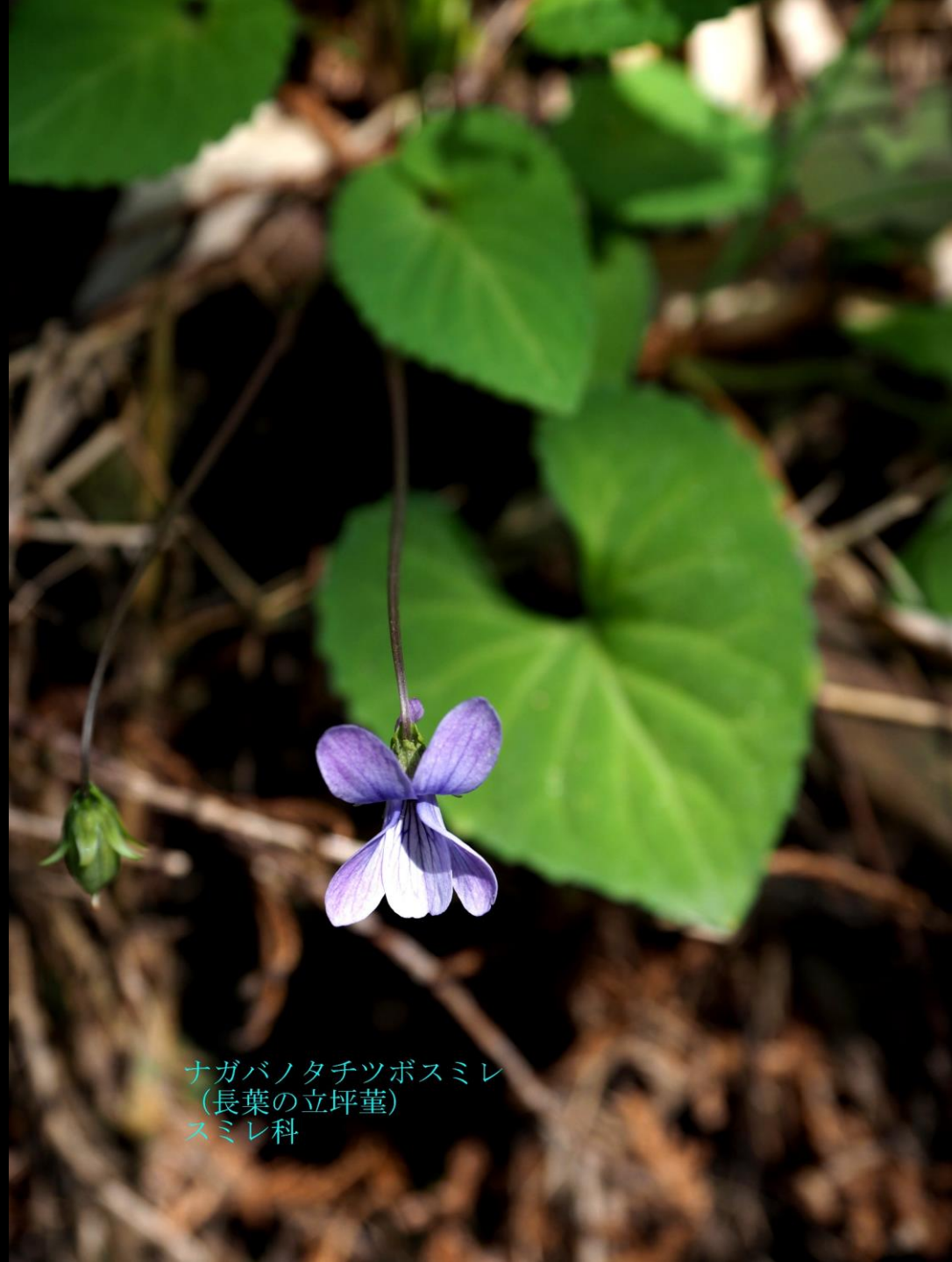
ナガバナタチツボスミレ (長葉の立坪堇) スミレ科