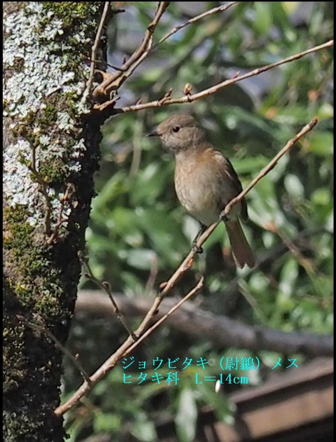
ジョウビタキ (尉鷓) メス ヒタキ科 L=14cm