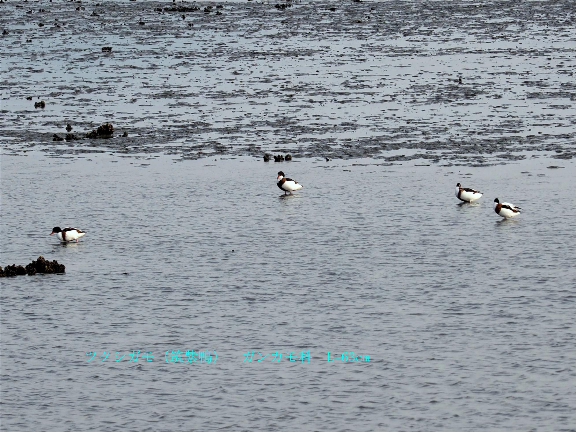
ツクシガモ (筑紫鴨) ガンカモ科 L=63cm