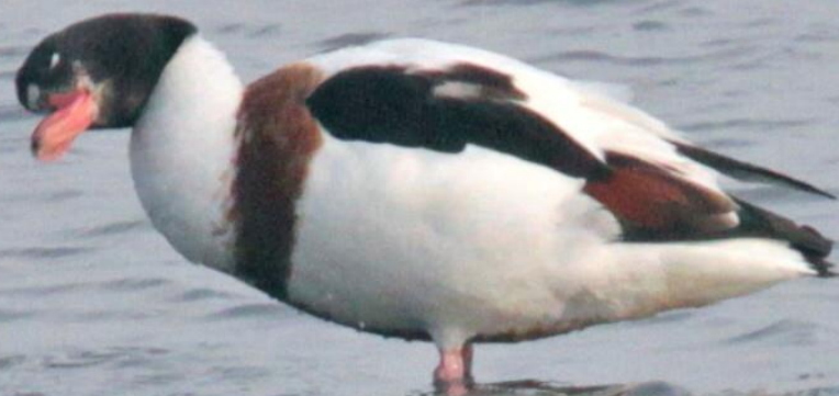
ツクシガモ (筑紫鴨) ガンカモ科 L=63cm