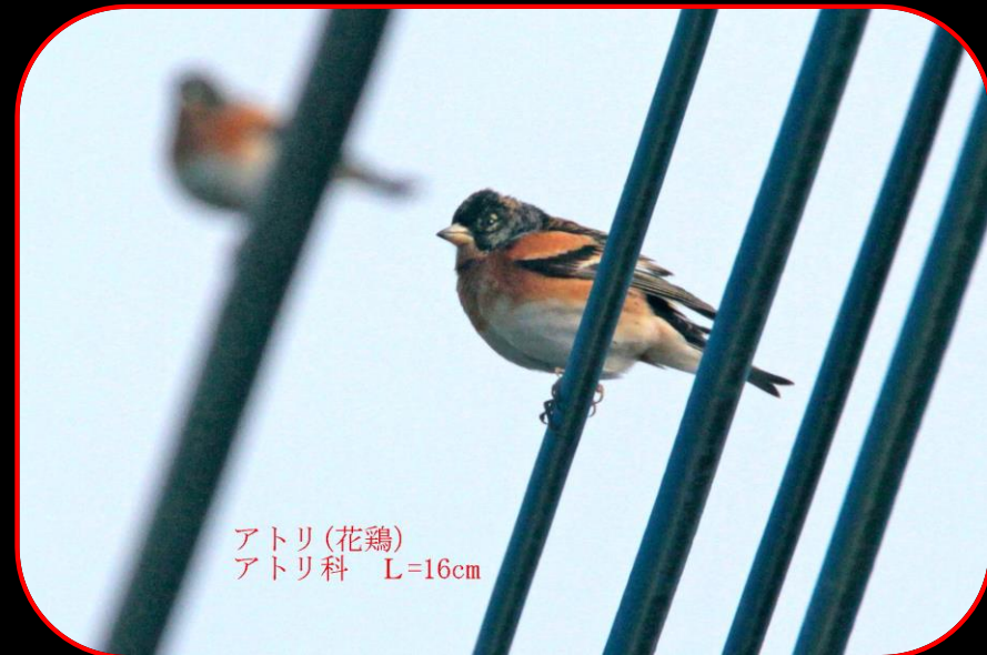
アトリ (花鶏) アトリ科 L=16cm