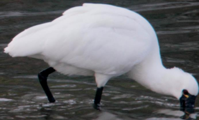
クロツラヘラサギ (黒面鏡鷺) トキ科 L=77cm