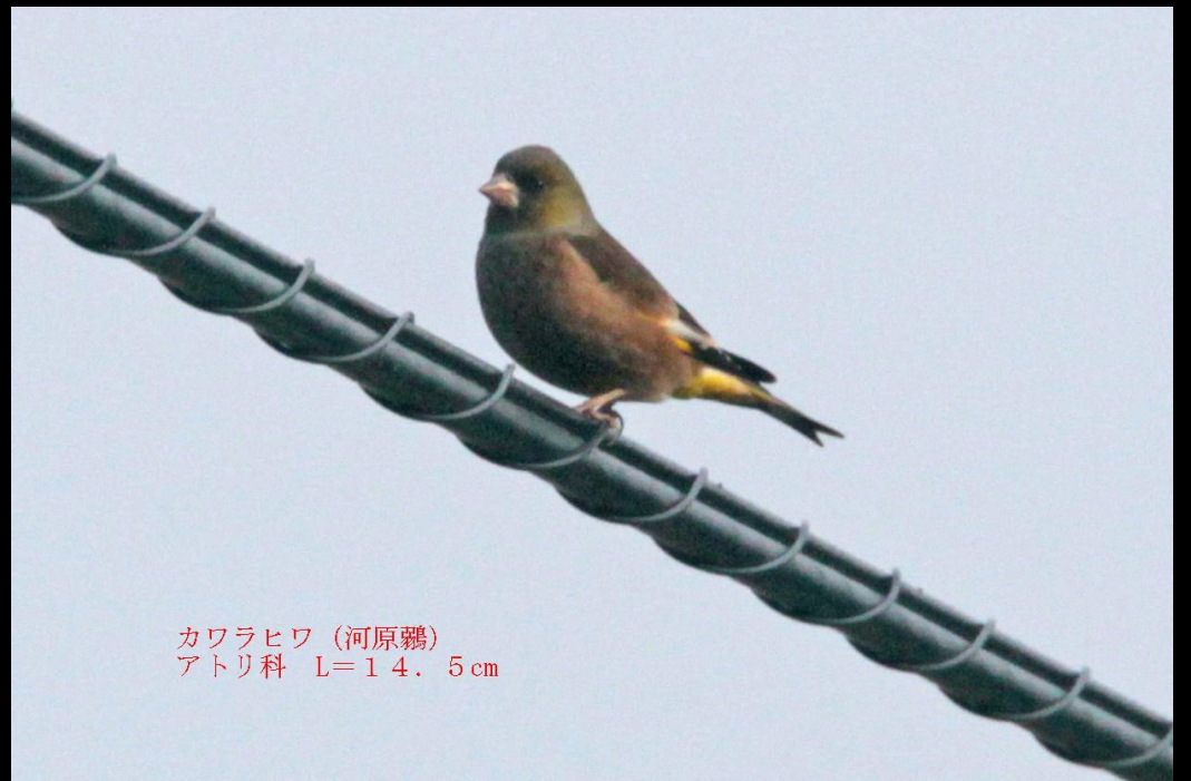
カラヒワ (河原鶉) アトリ科 L=14.5cm