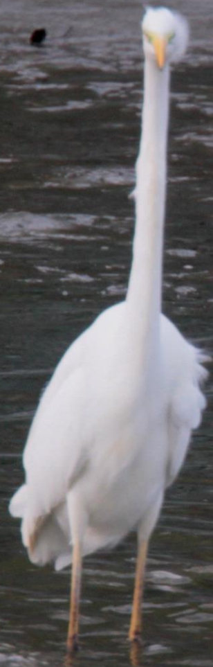
ダイサギ (大鷺) サギ科 L=90cm