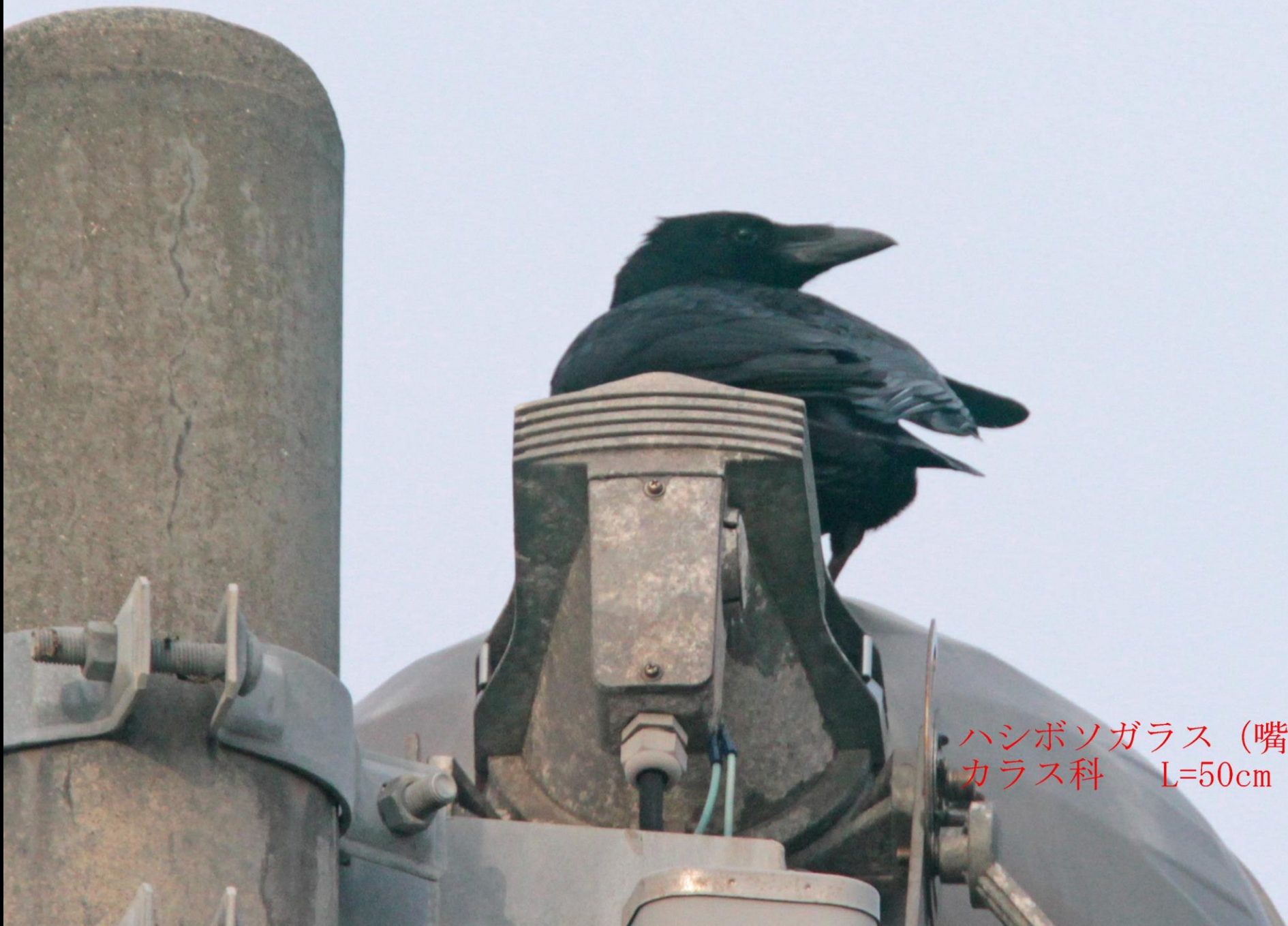
ハシボソガラス (嘴細鴉) カラス科 L=50cm