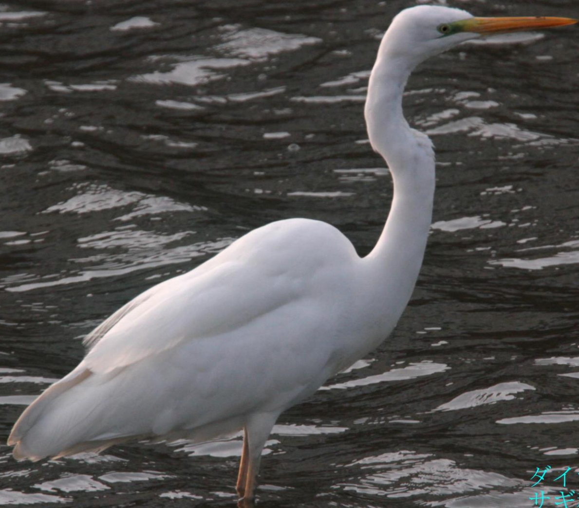
ダイサギ (大鷺) サギ科 L=90cm