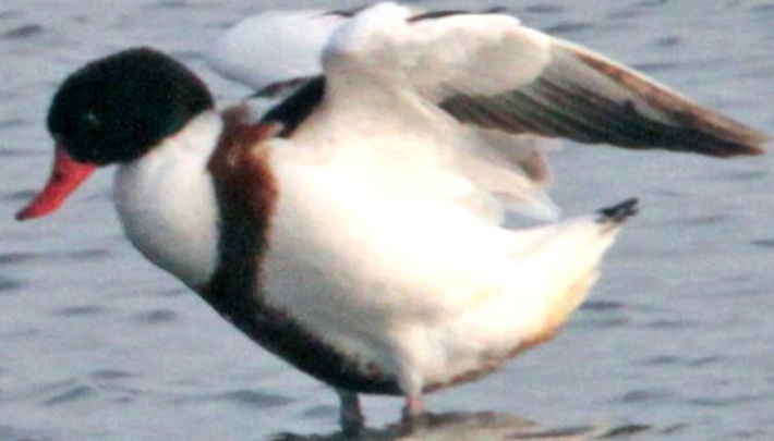
ツクシガモ (筑紫鴨) ガンカモ科 L=63cm