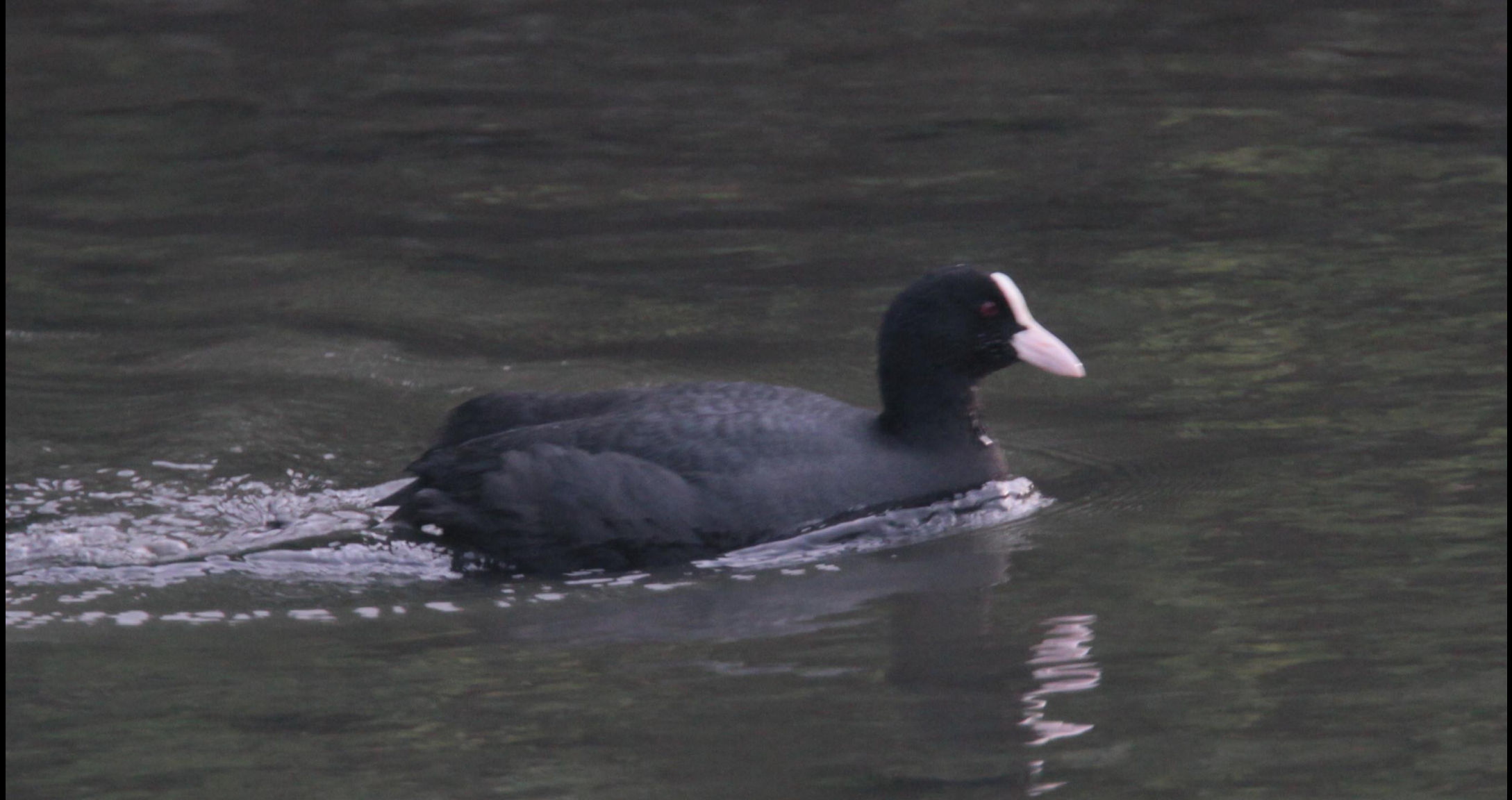
オオバン (大鵜) クイナ科 L=39cm