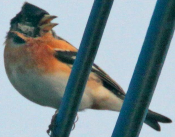
アトリ (花鶏) アトリ科 L=16cm