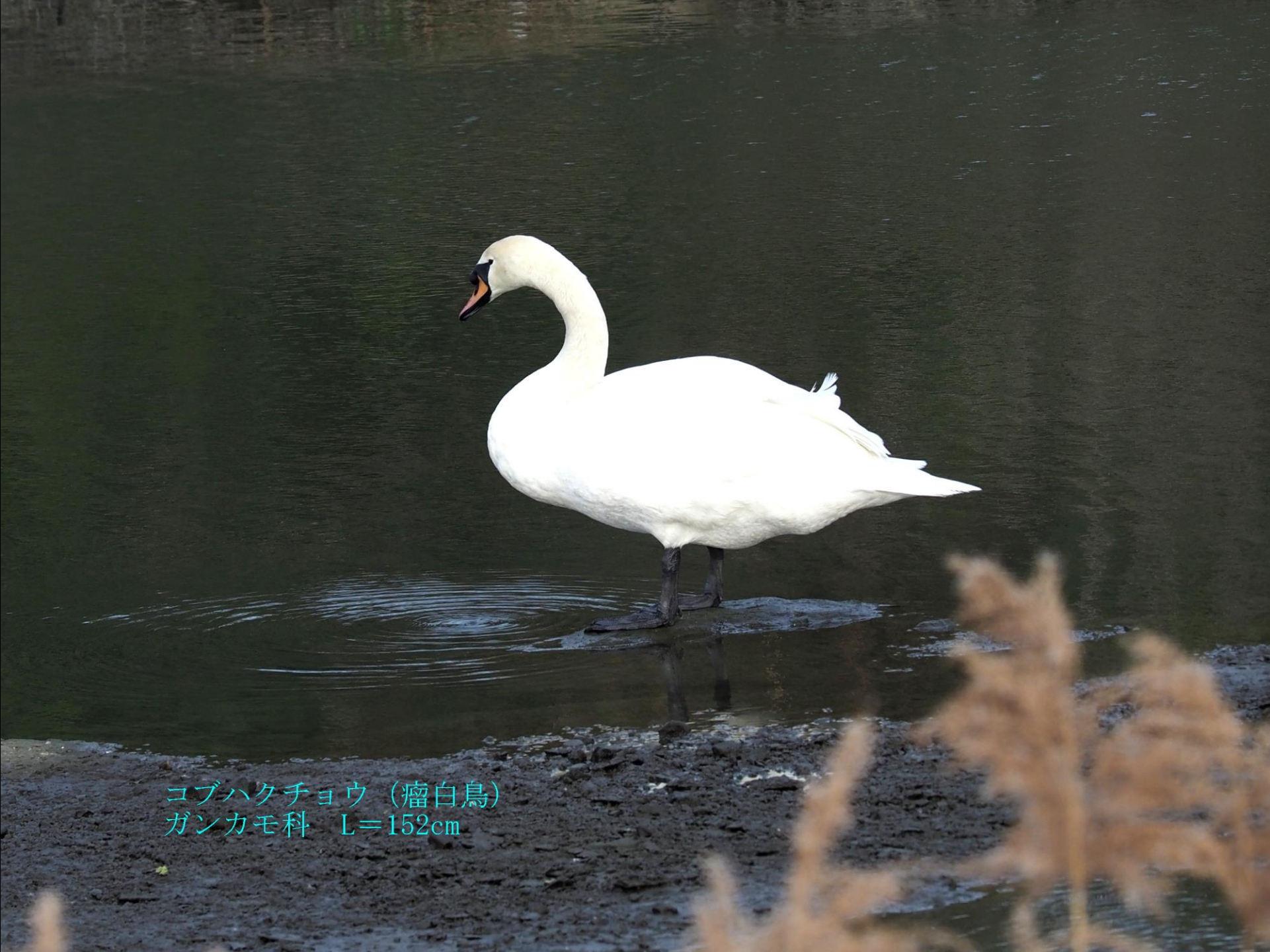
ヨブハクチョウ (瘤白鳥) ガンカモ科 L=152cm