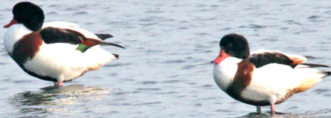
ツクシガモ (筑紫鴨) ガンカモ科 L=63