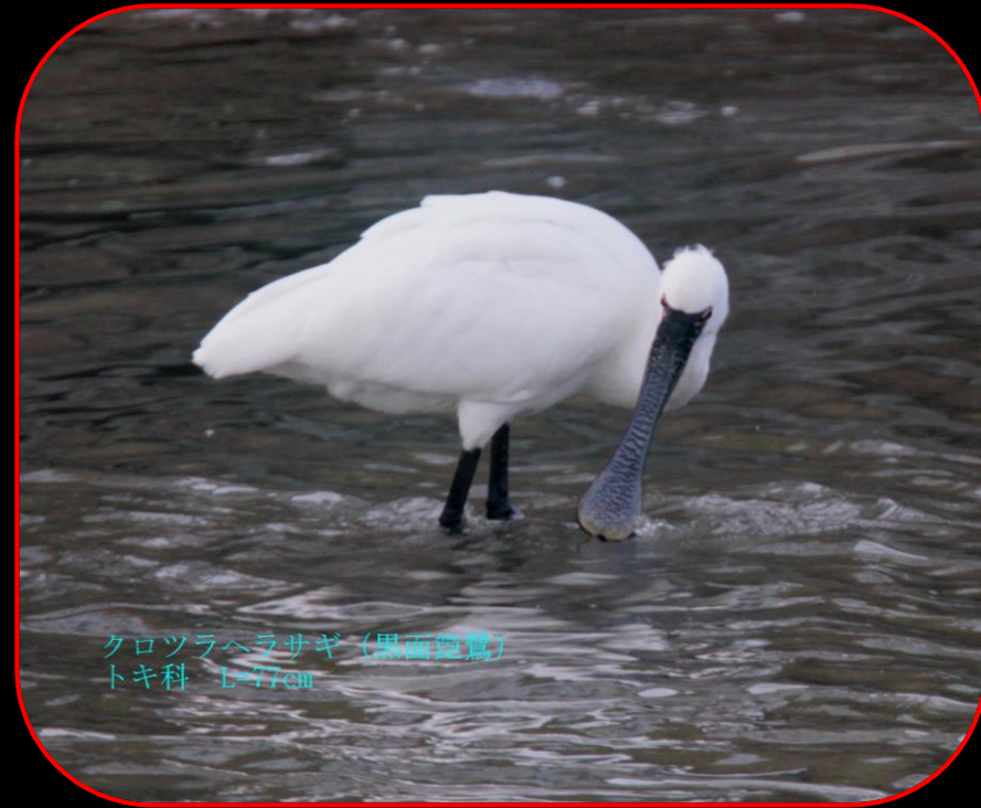
クロツラヘラサギ (黒面琵鷺) トキ科 L=77cm