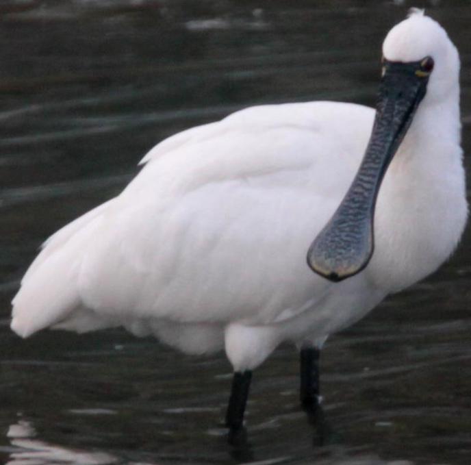
クロツラヘラサギ（黒面篋鷺） トキ科 L=77cm