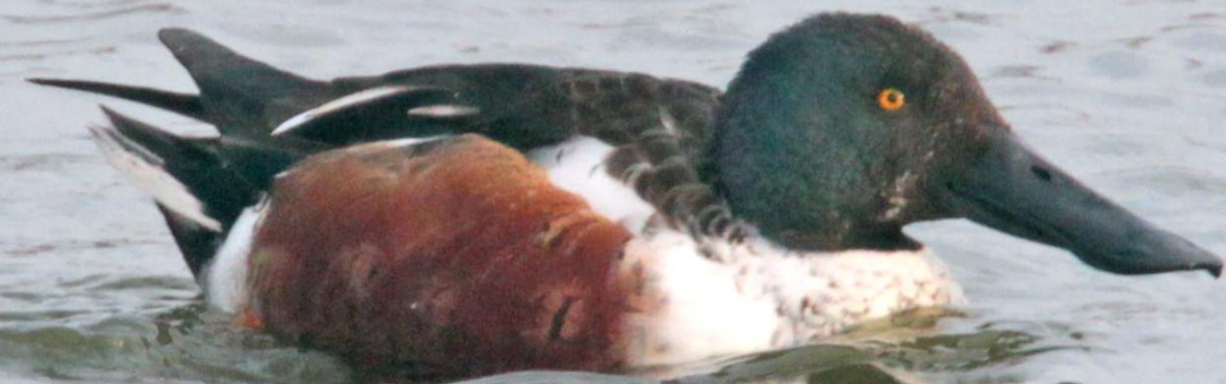
ハシビロガモ (嘴広鴨) オス ガンカモ科 L=50cm