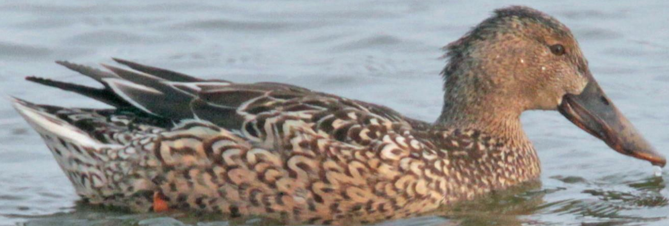
ハシビロガモ (嘴広鴨) メス ガンカモ科 L=50cm