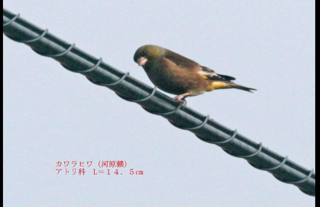
カラヒワ (河原鶉) アトリ科 L=14.5cm