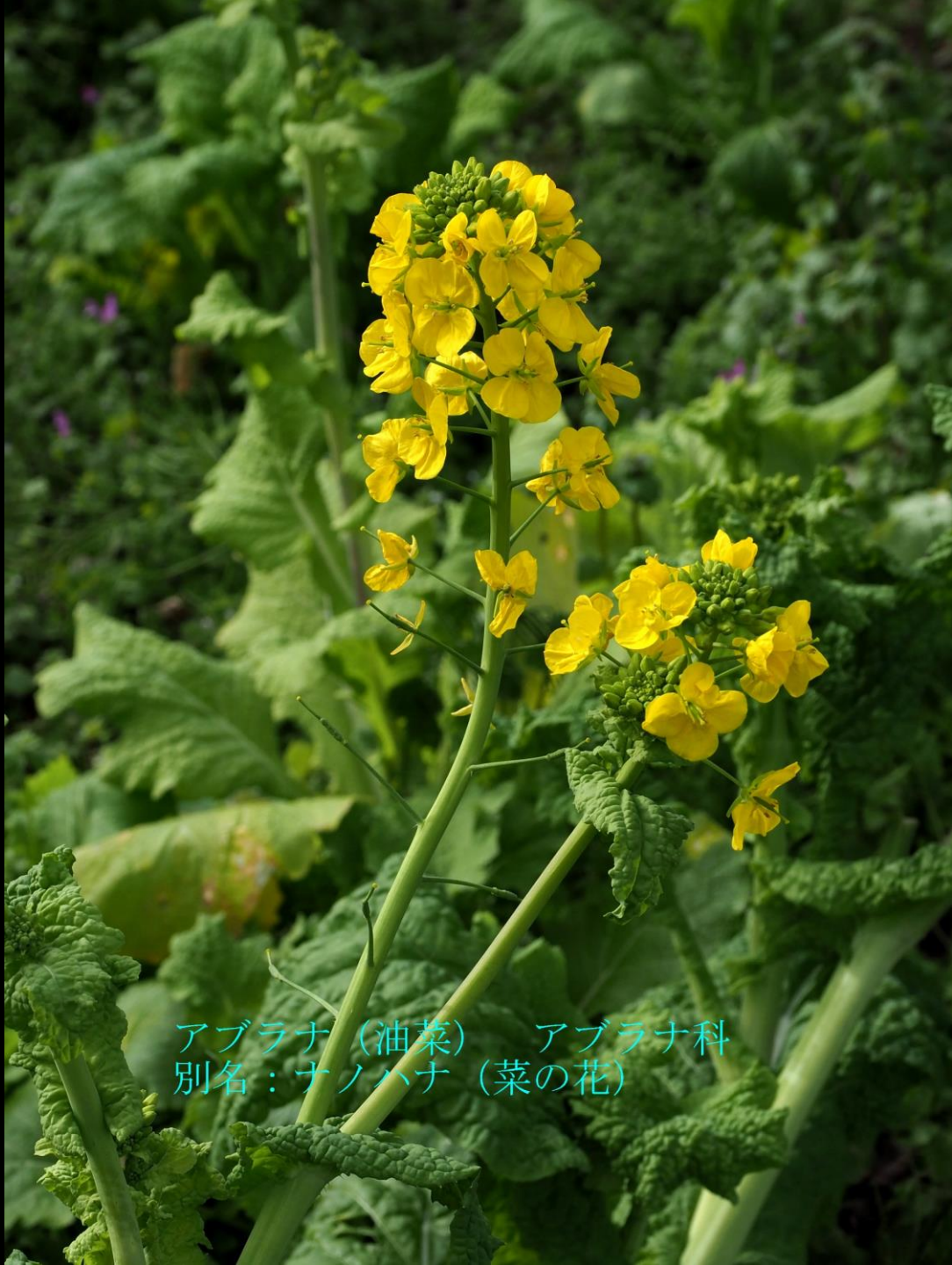
アブラナ (油菜) アブラナ科 別名：ナノハナ (菜の花)