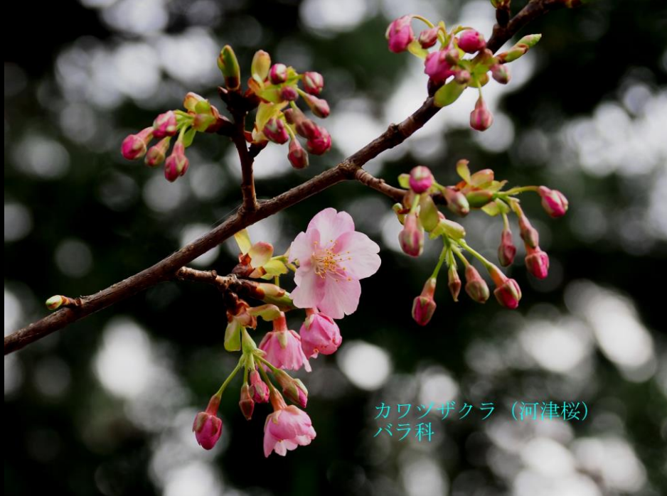
カワヅザクラ (河津桜) バラ科