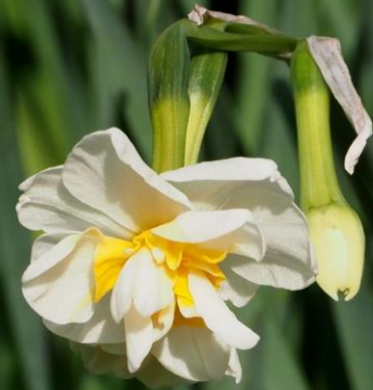
スイセン (水仙) ヒガンバナ科 有毒 別名：雪中花