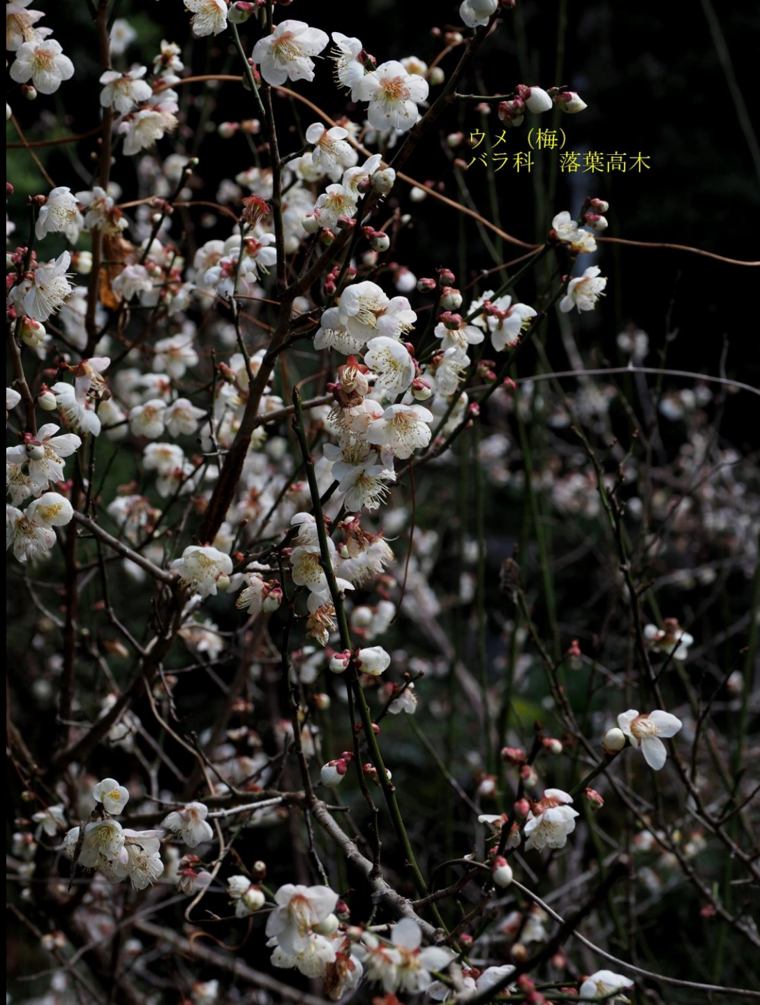
ウメ (梅) バラ科 落葉高木