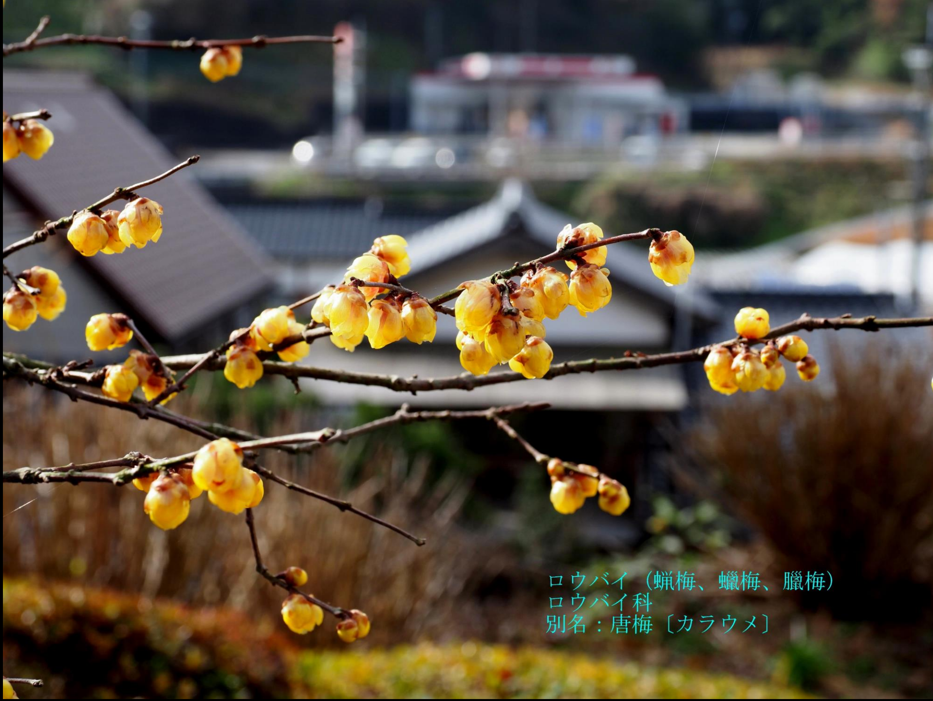
ロウバイ (蠟梅、蠟梅、臘梅) ロウバイ科 別名：唐梅 [カラウメ]