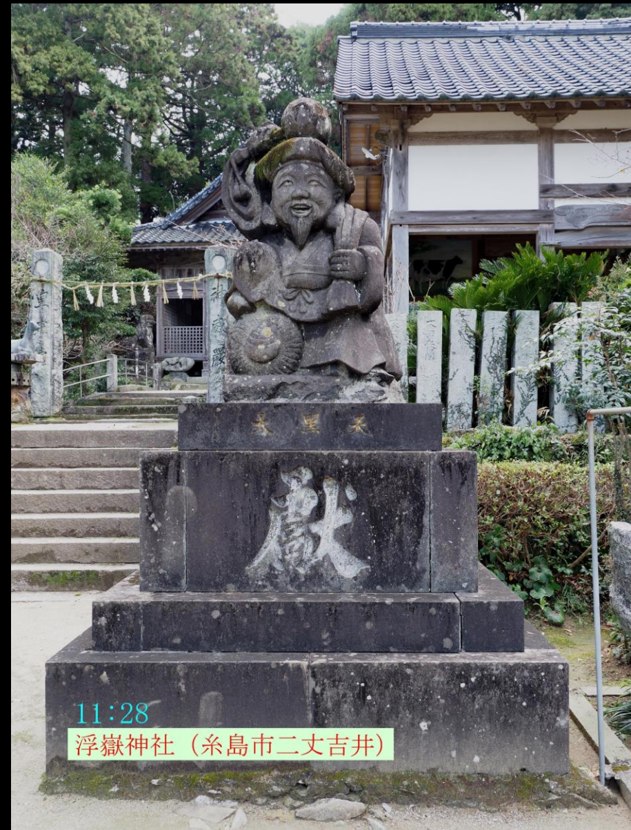
11:28 浮嶽神社 (糸島市二丈吉井)