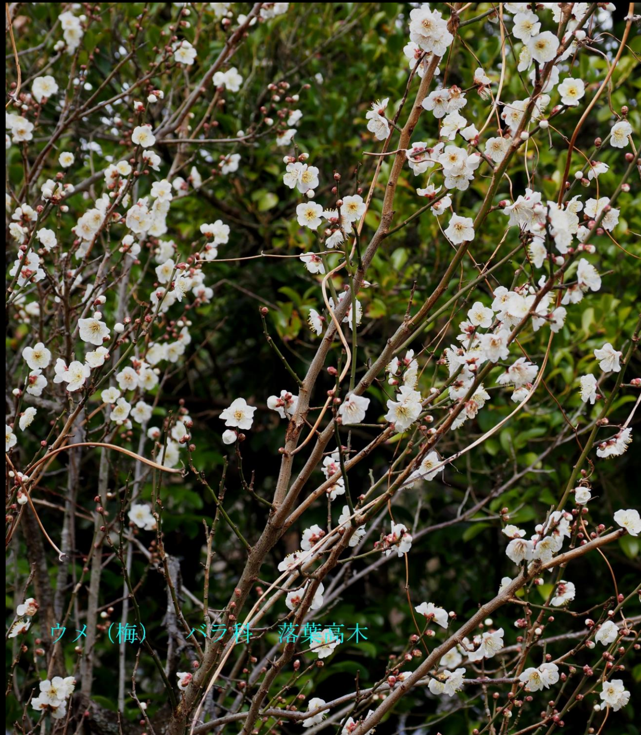
ウメ (梅) バラ科 落葉高木