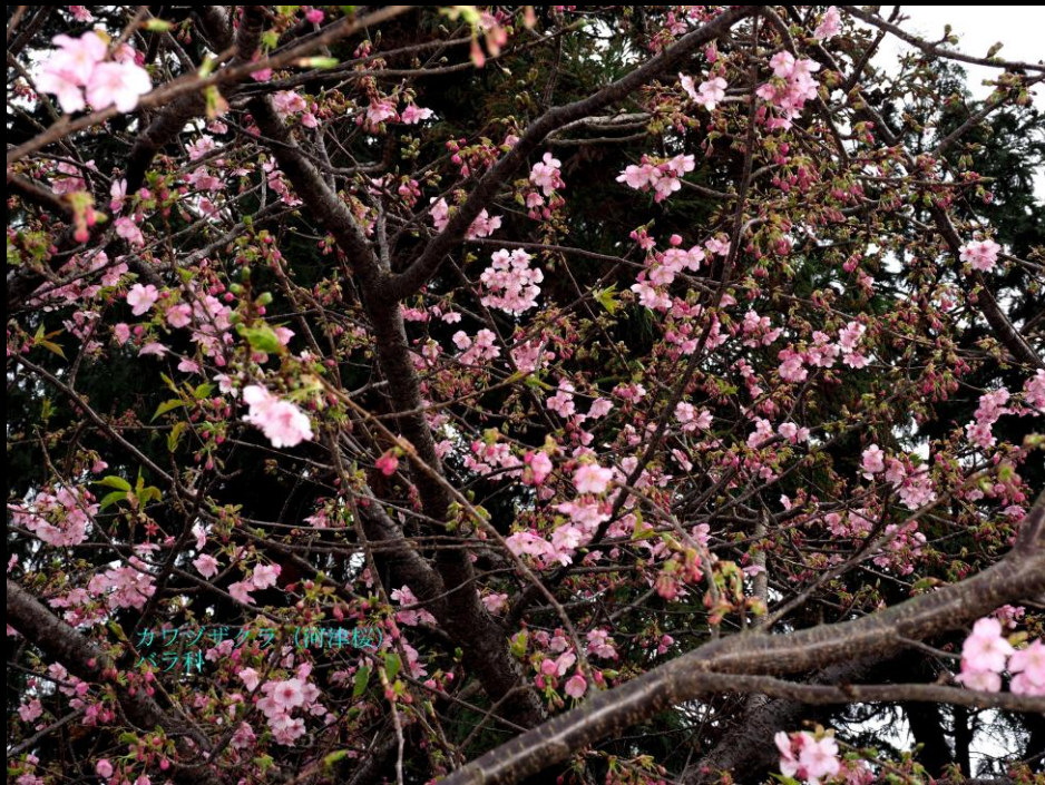
カワヅザクラ (河津桜) バラ科