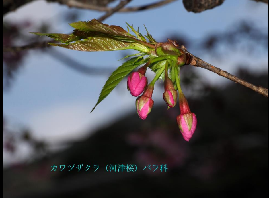
カワヅザクラ (河津桜) バラ科