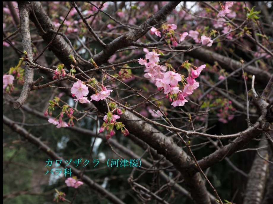
カワヅザクラ (河津桜) バラ科