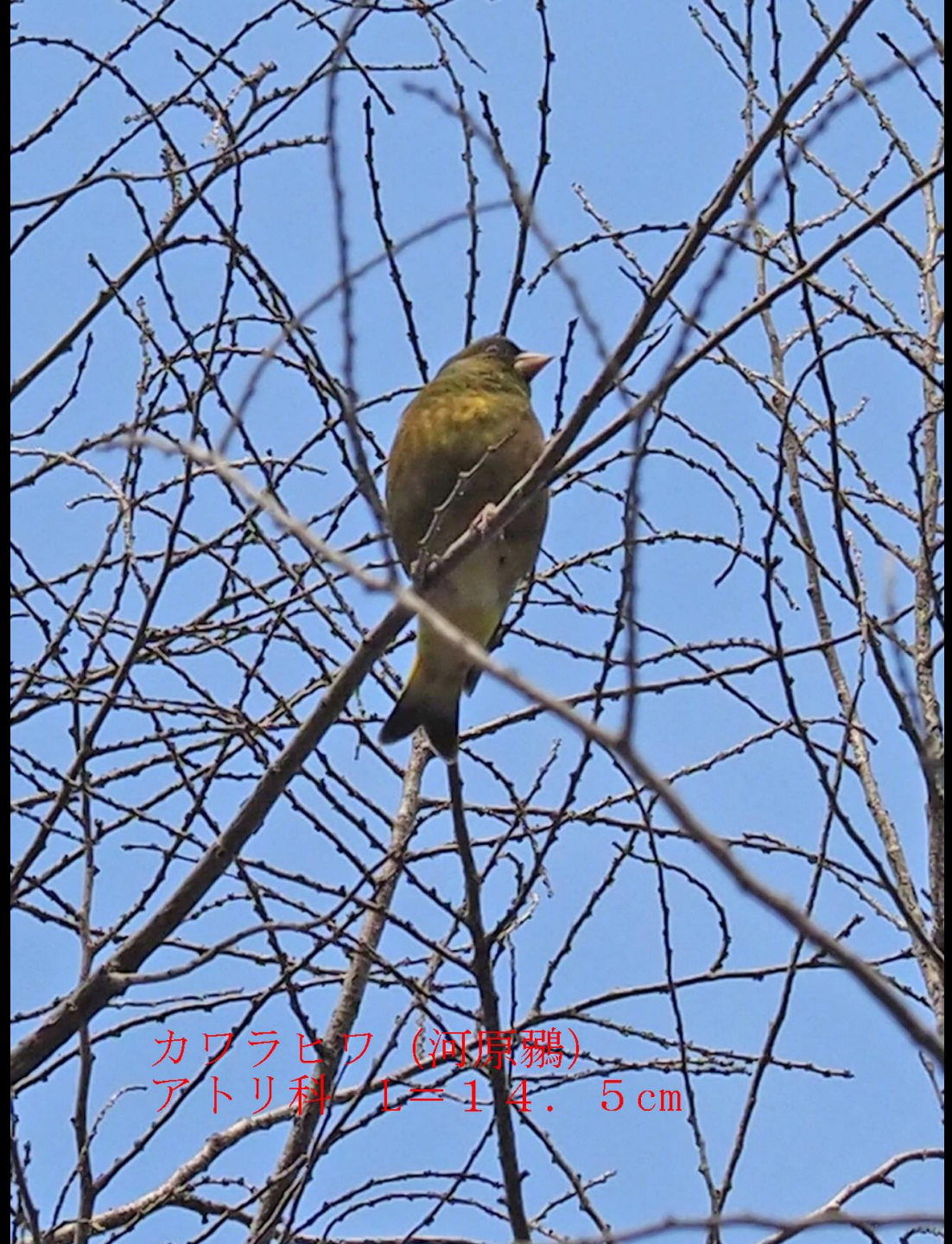
カワラヒワ (河原鶉) アトリ科 L=14.5 cm