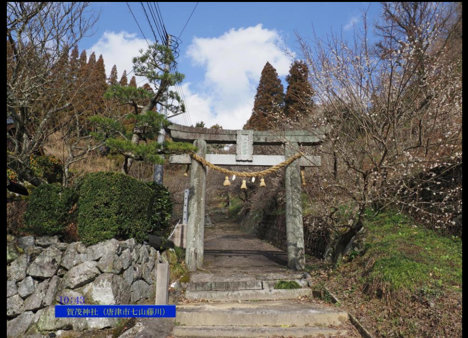
10743 賀茂神社 (唐津市七山藤川)