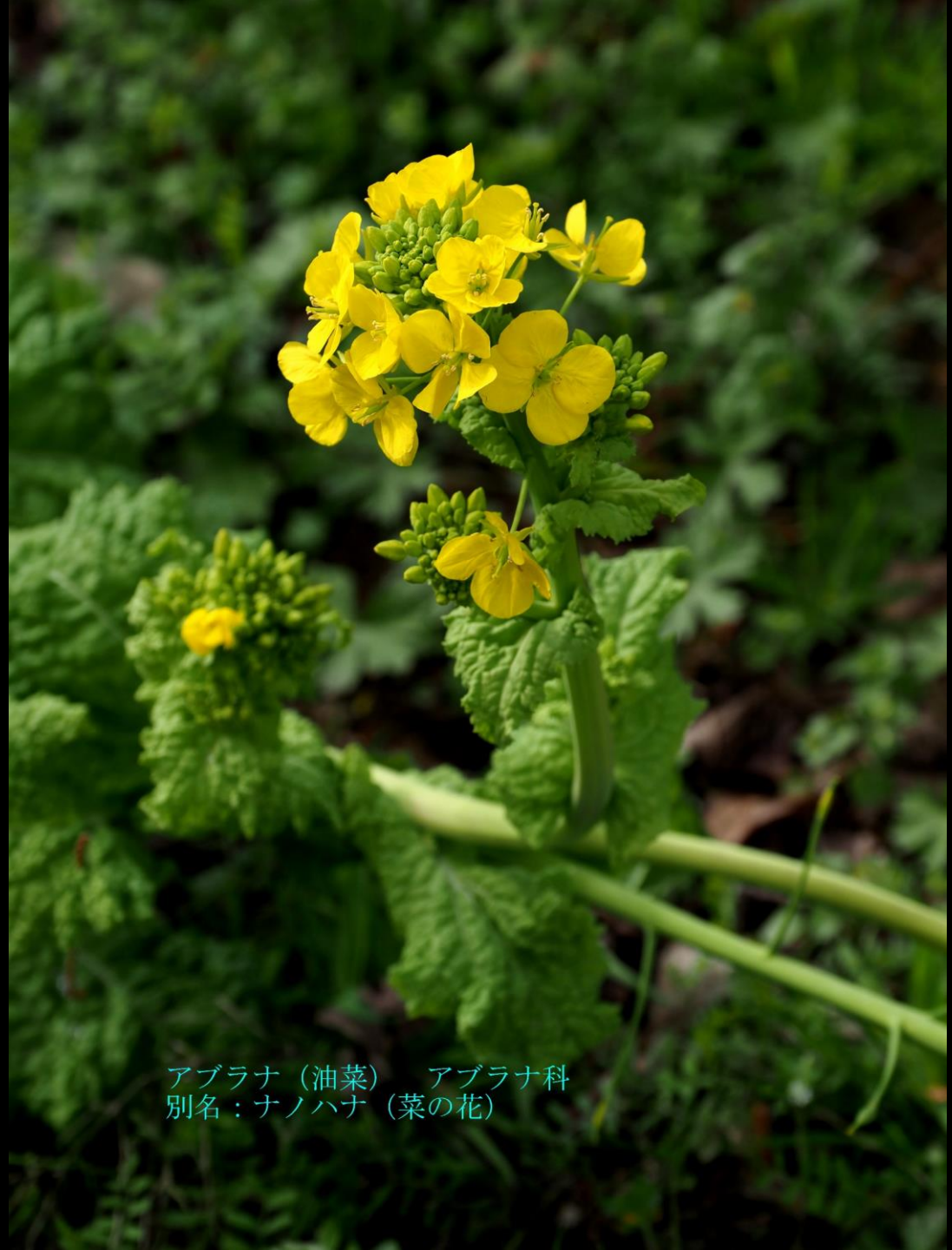
アブラナ (油菜) アブラナ科 別名：ナノハナ (菜の花)