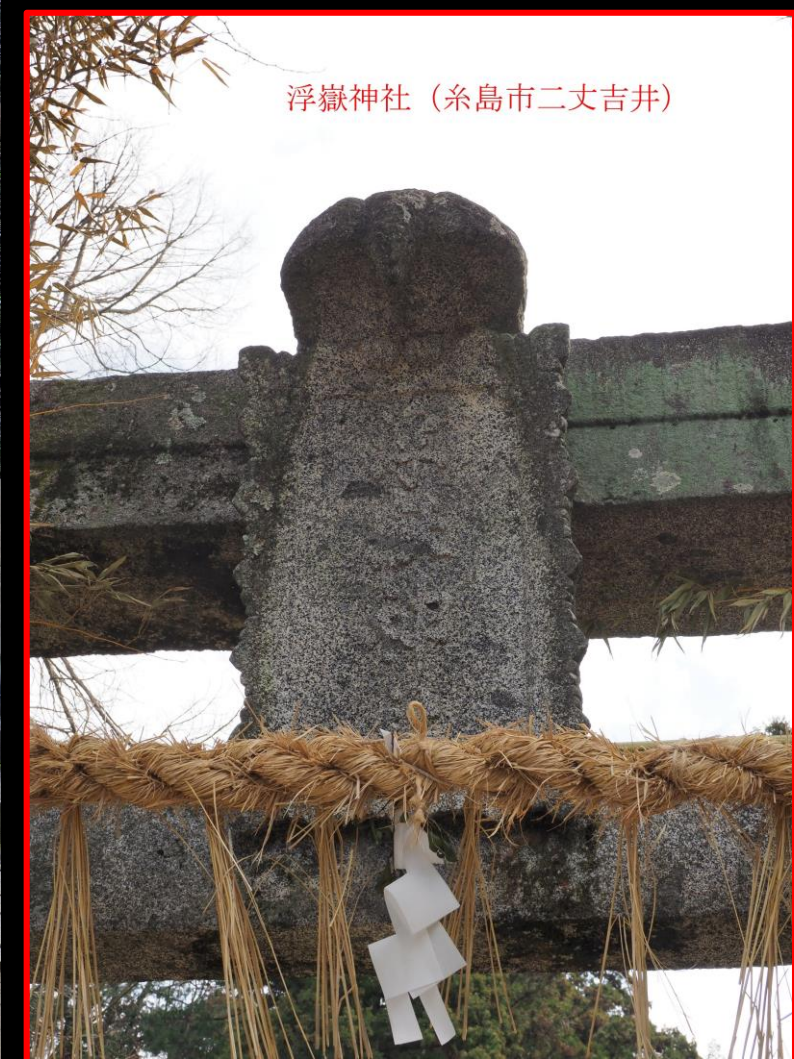
浮嶽神社 (糸島市二丈吉井)