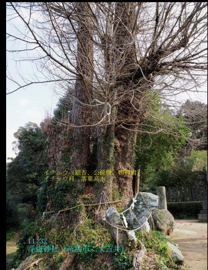
イチヨウ (銀杏、公孫樹、鴨脚樹) イチヨウ科 落葉高木