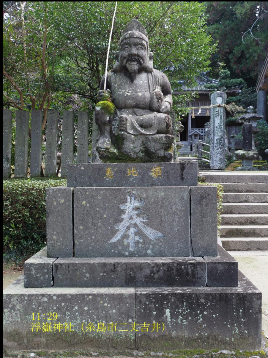
11:29 浮嶽神社 (糸島市二丈吉井)