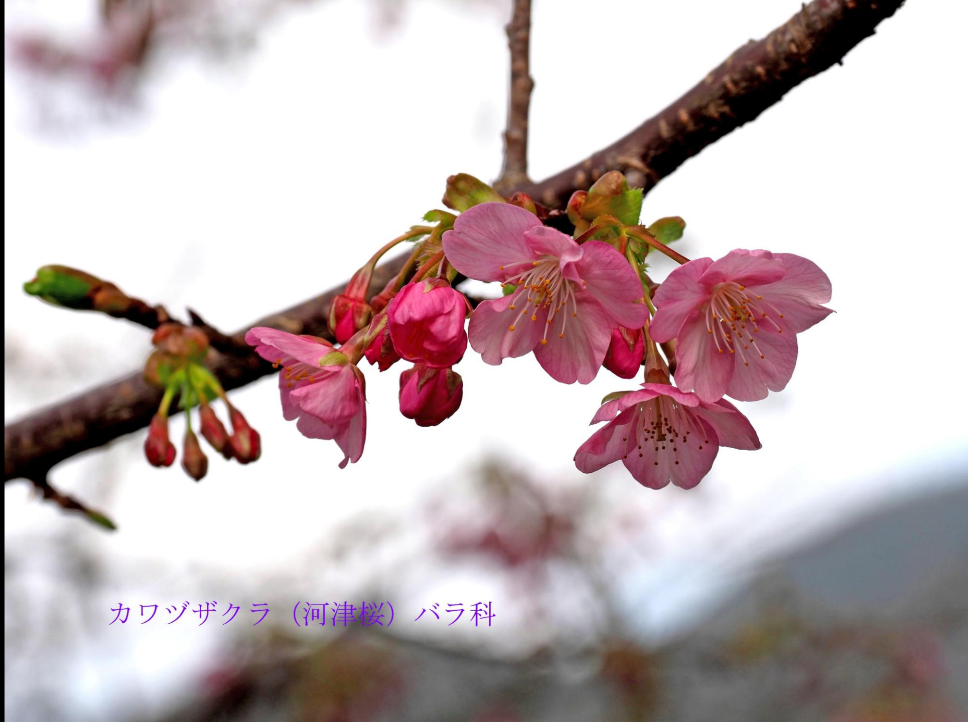
カワヅザクラ (河津桜) バラ科