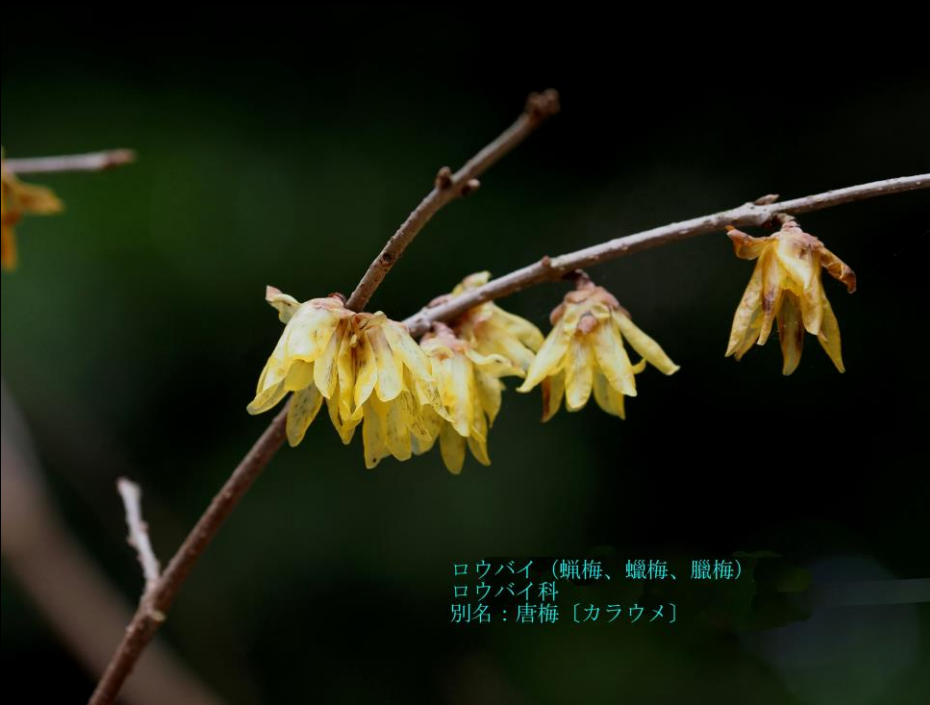
ロウバイ (蠟梅、蠟梅、臘梅) ロウバイ科 別名: 唐梅 [カラウメ]