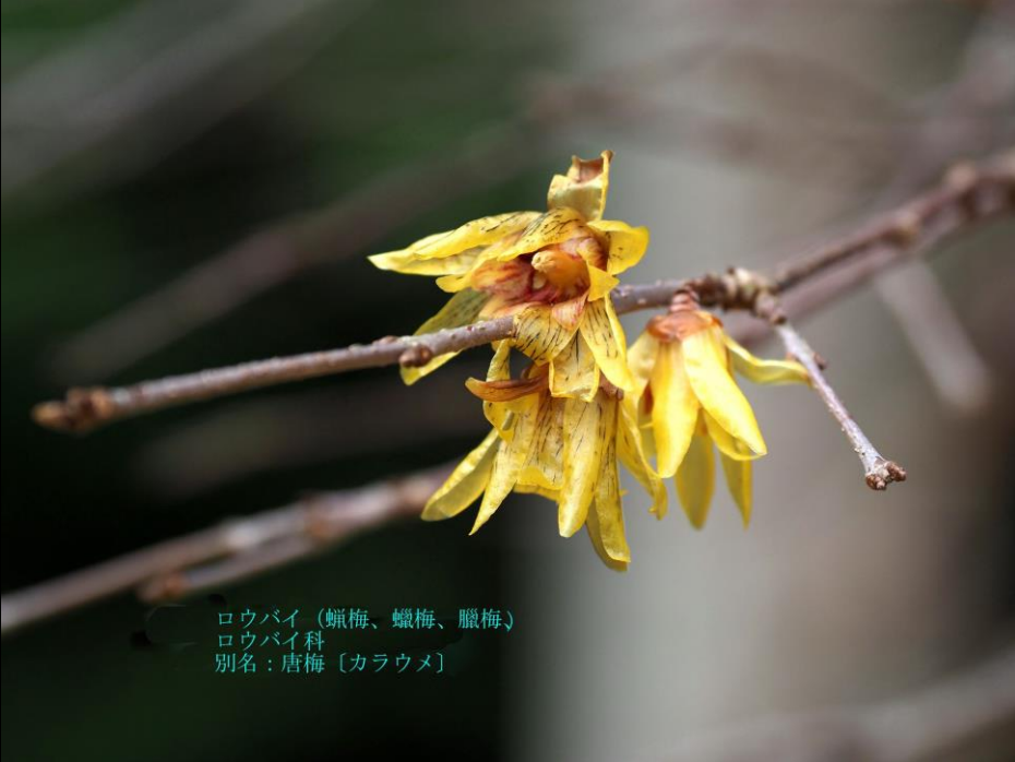
ロウバイ (蠟梅、蠟梅、臘梅) ロウバイ科 別名: 唐梅 [カラウメ]