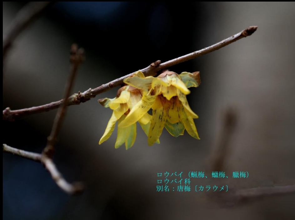
ロウバイ (蠟梅、蠟梅、臘梅) ロウバイ科 別名: 唐梅 [カラウメ]