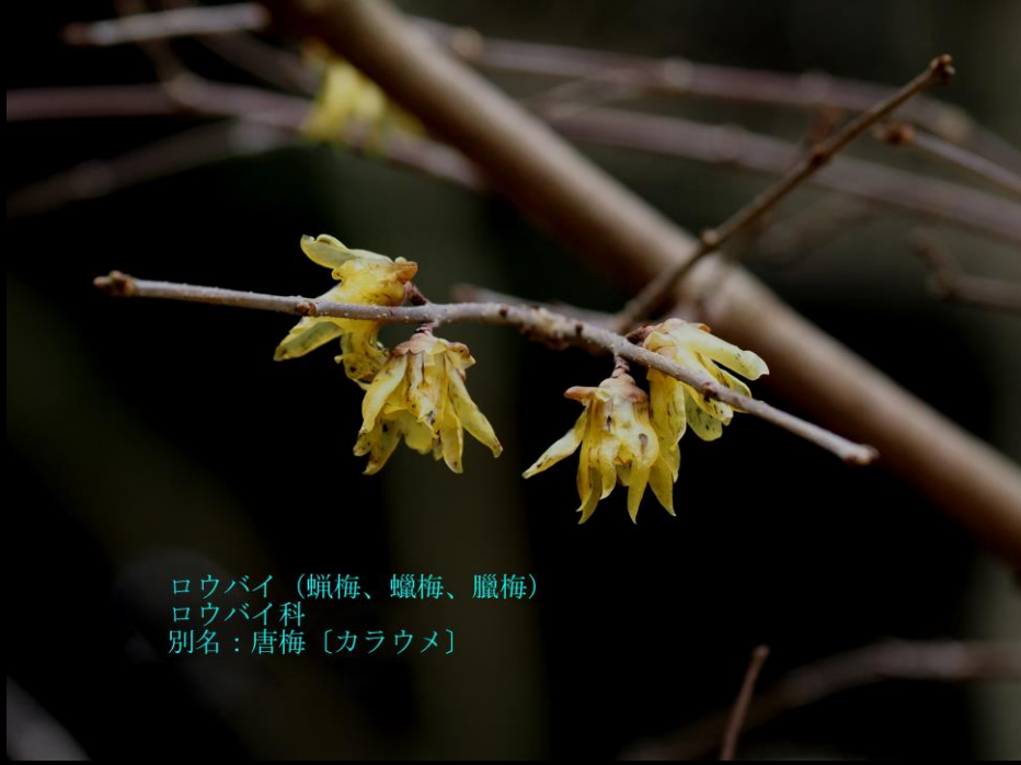
ロウバイ (蠟梅、蠟梅、臘梅) ロウバイ科 別名: 唐梅 [カラウメ]