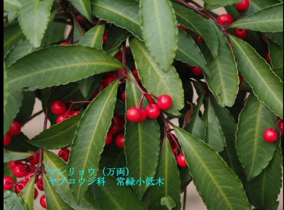
マンリョウ (万両) ヤブコウジ科 常緑小低木