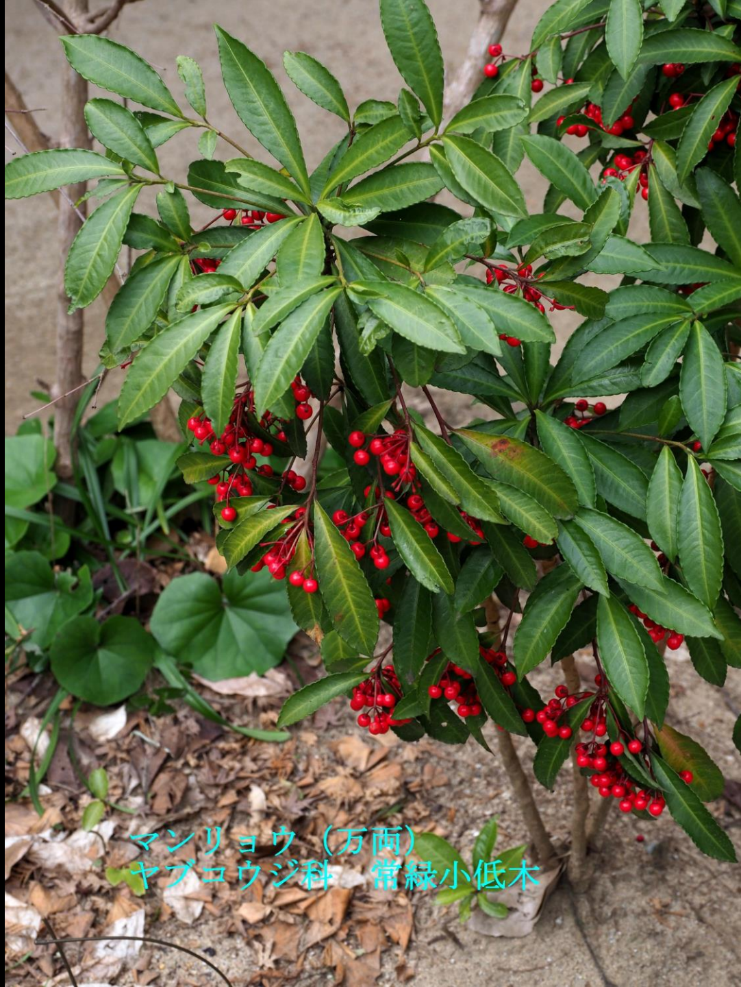
マンリョウ (万両) ヤブコウジ科 常緑小低木