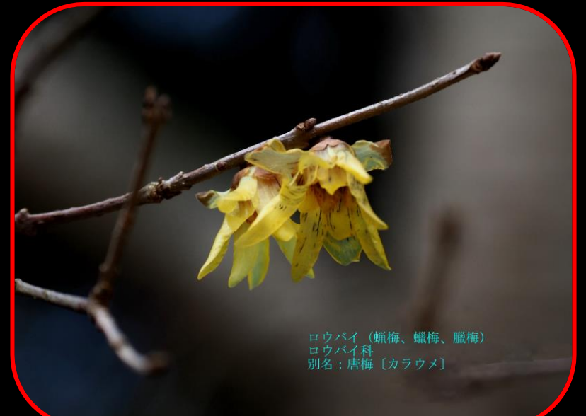
ロウバイ (蠟梅、蠟梅、臘梅) ロウバイ科 別名: 唐梅 [カラウメ]