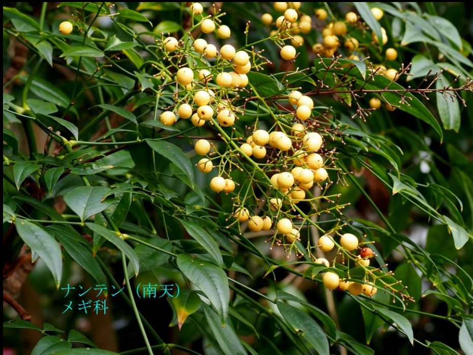
ナンテン (南天) メギ科