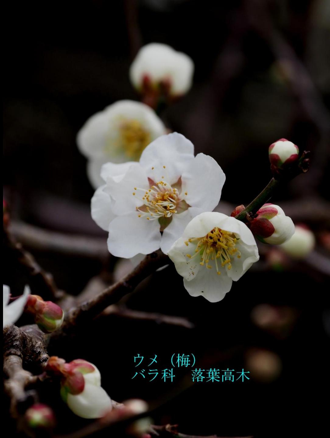
ウメ (梅) バラ科 落葉高木