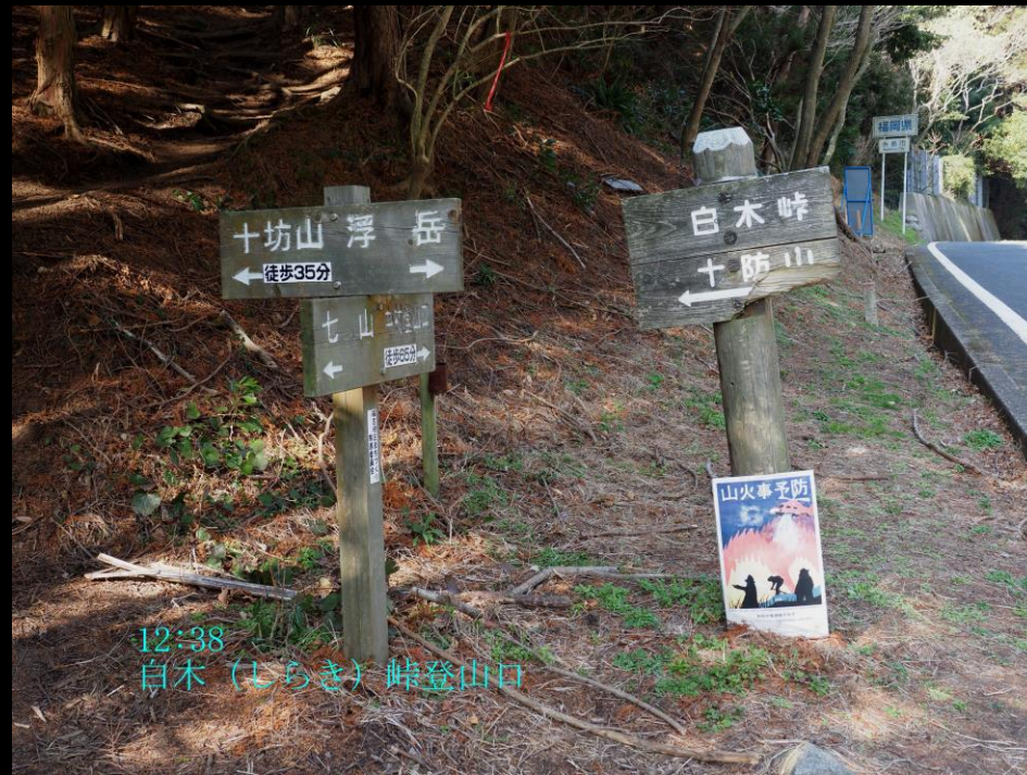
12:38 白木 (しらぎ) 峠登山口