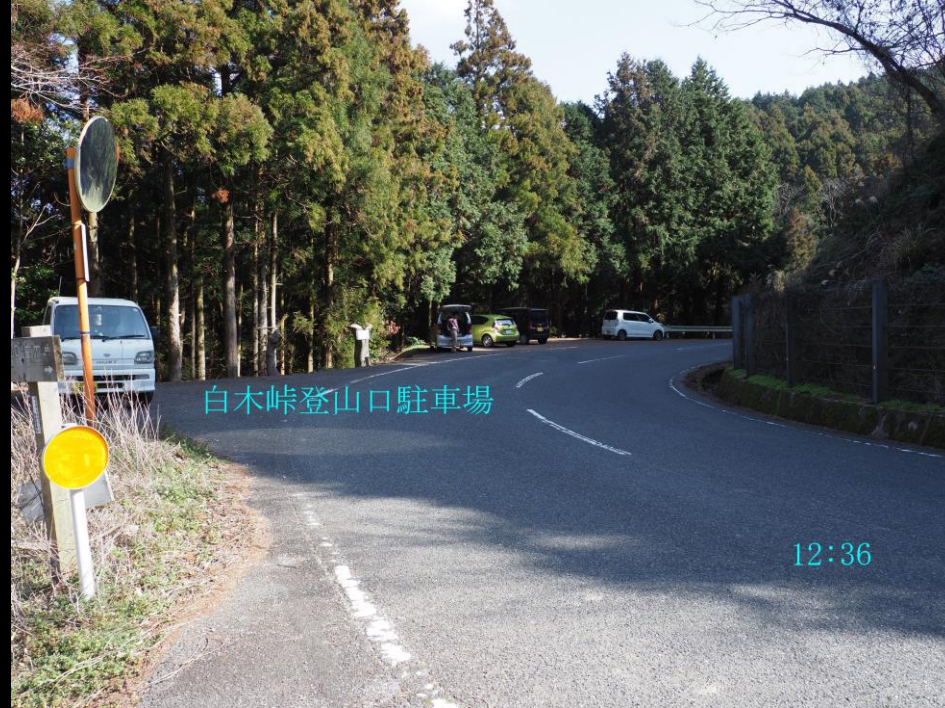
白木峠登山口駐車場