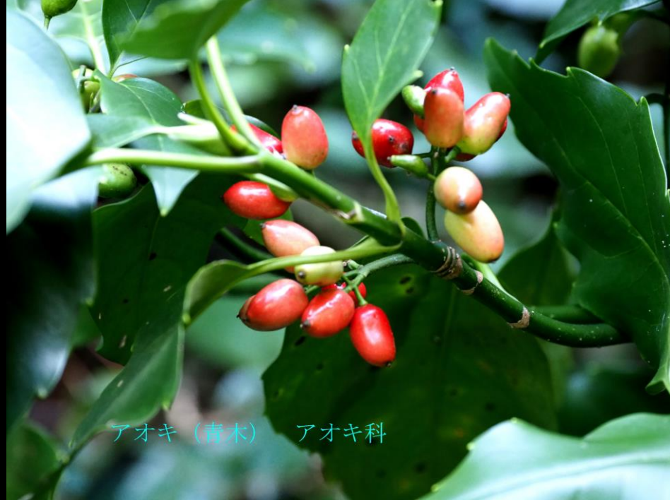
アオキ (青木) アオキ科