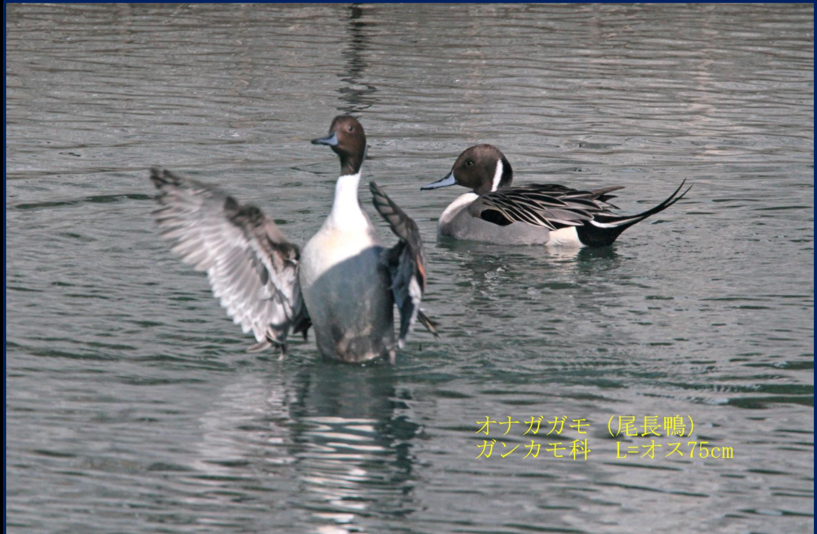
オナガガモ (尾長鴨) ガンカモ科 L=オス75cm