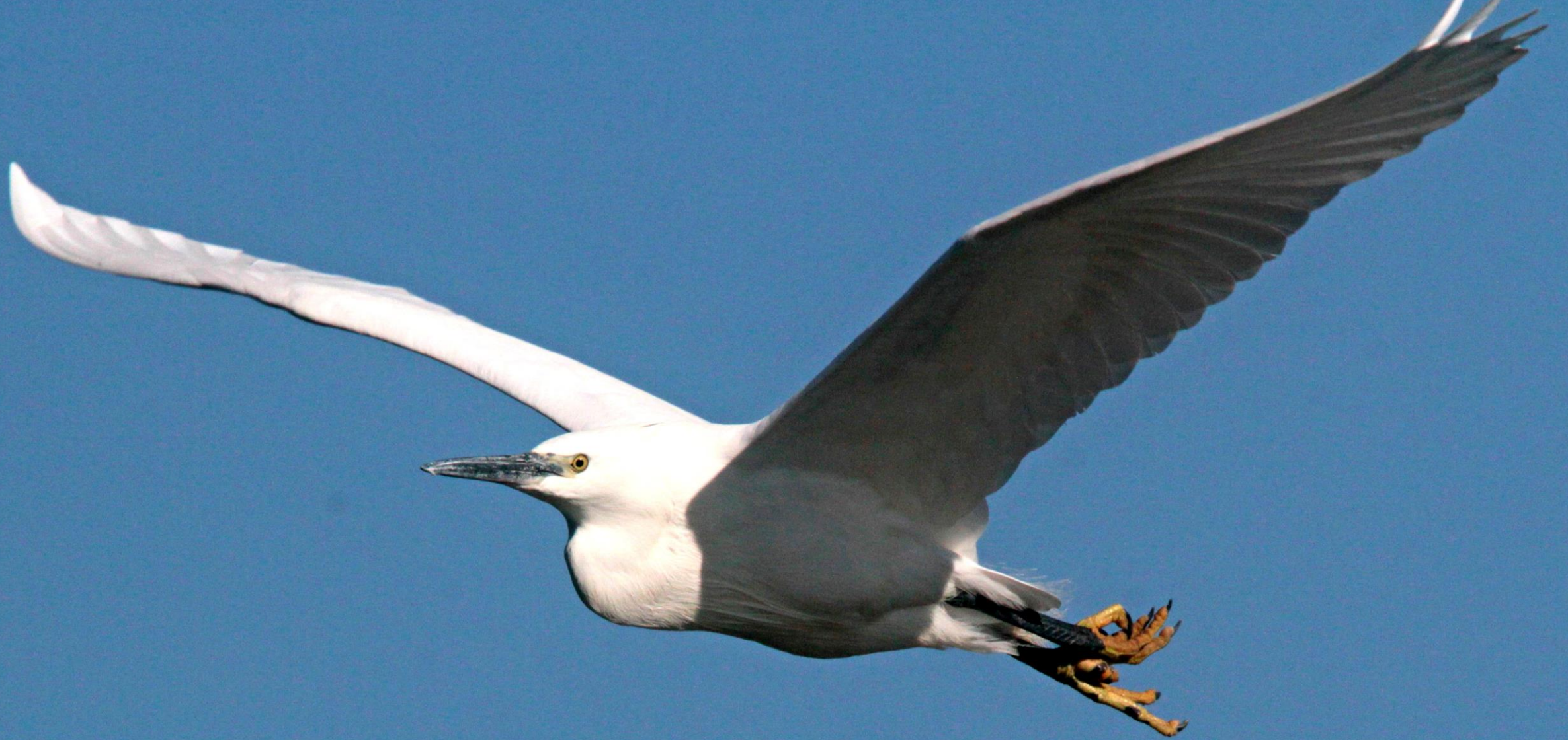
コサギ (小鷺) サギ科 L=61cm