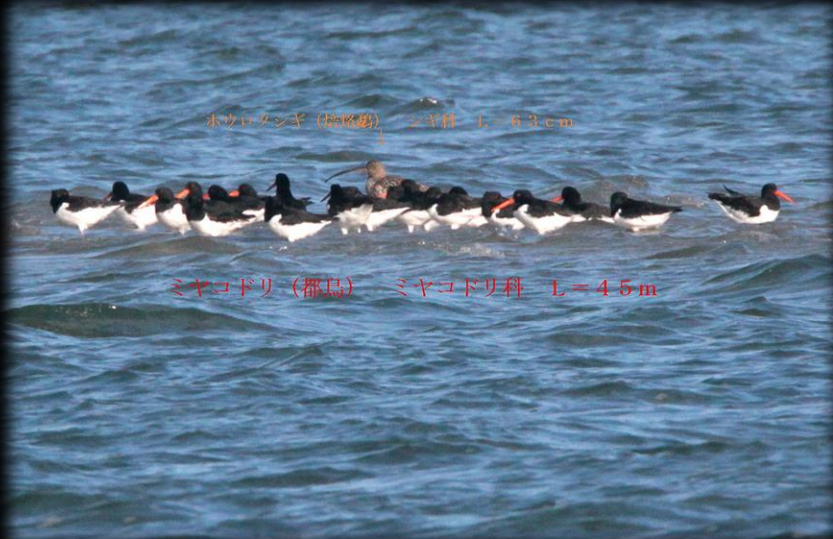
ホシロタンギ (約8羽) シヤ科 L=63cm