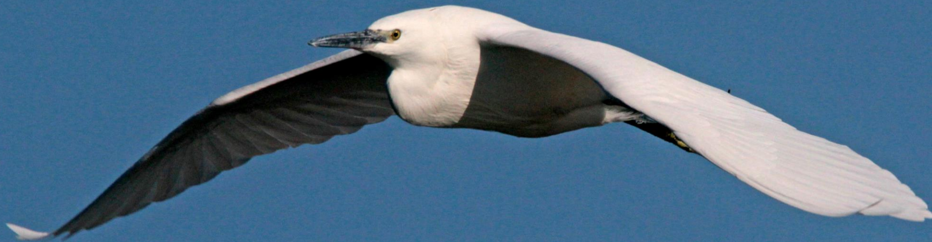
コサギ (小鷺) サギ科 L=61cm