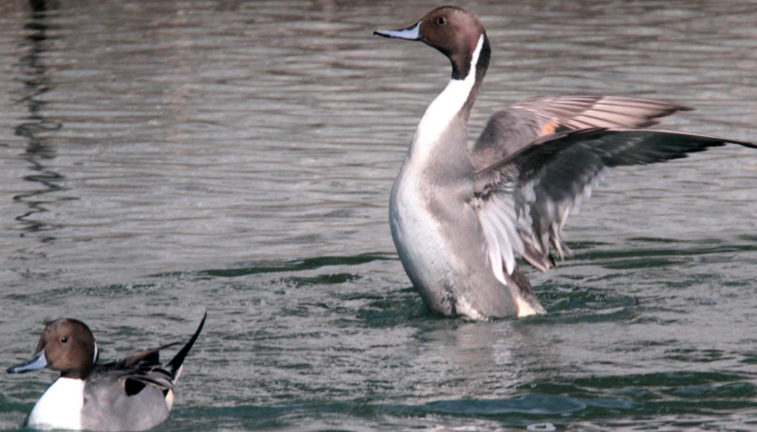
オナガガモ (尾長鴨) ガンカモ科 L=オス75cm