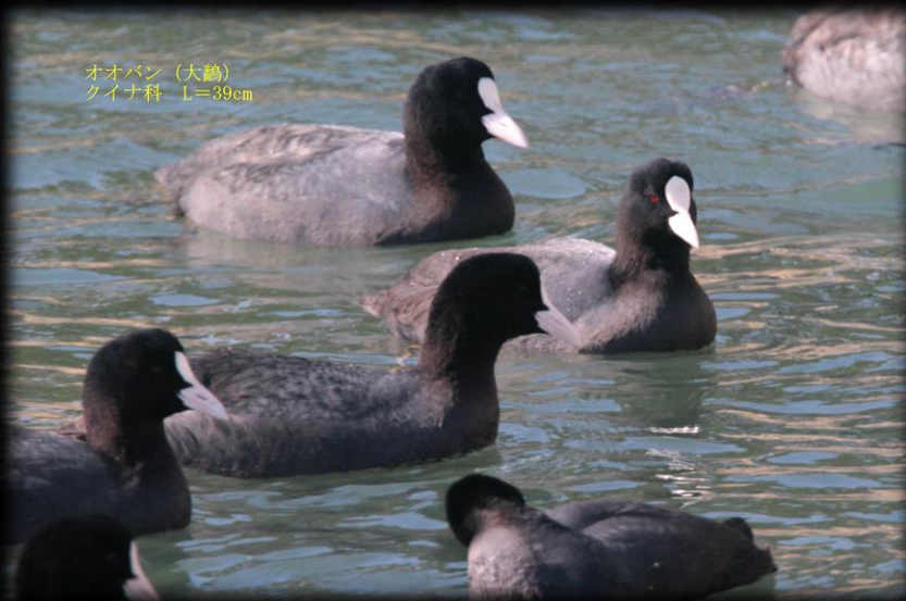
オオバン (大約) クイナ科 L=39cm