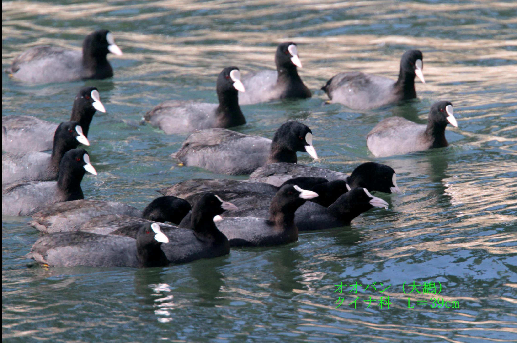
オオバン (大鵜) タイナ科 L=39cm