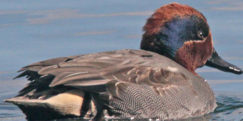
コガモ (小鴨) オス ガンカモ科 L=38cm