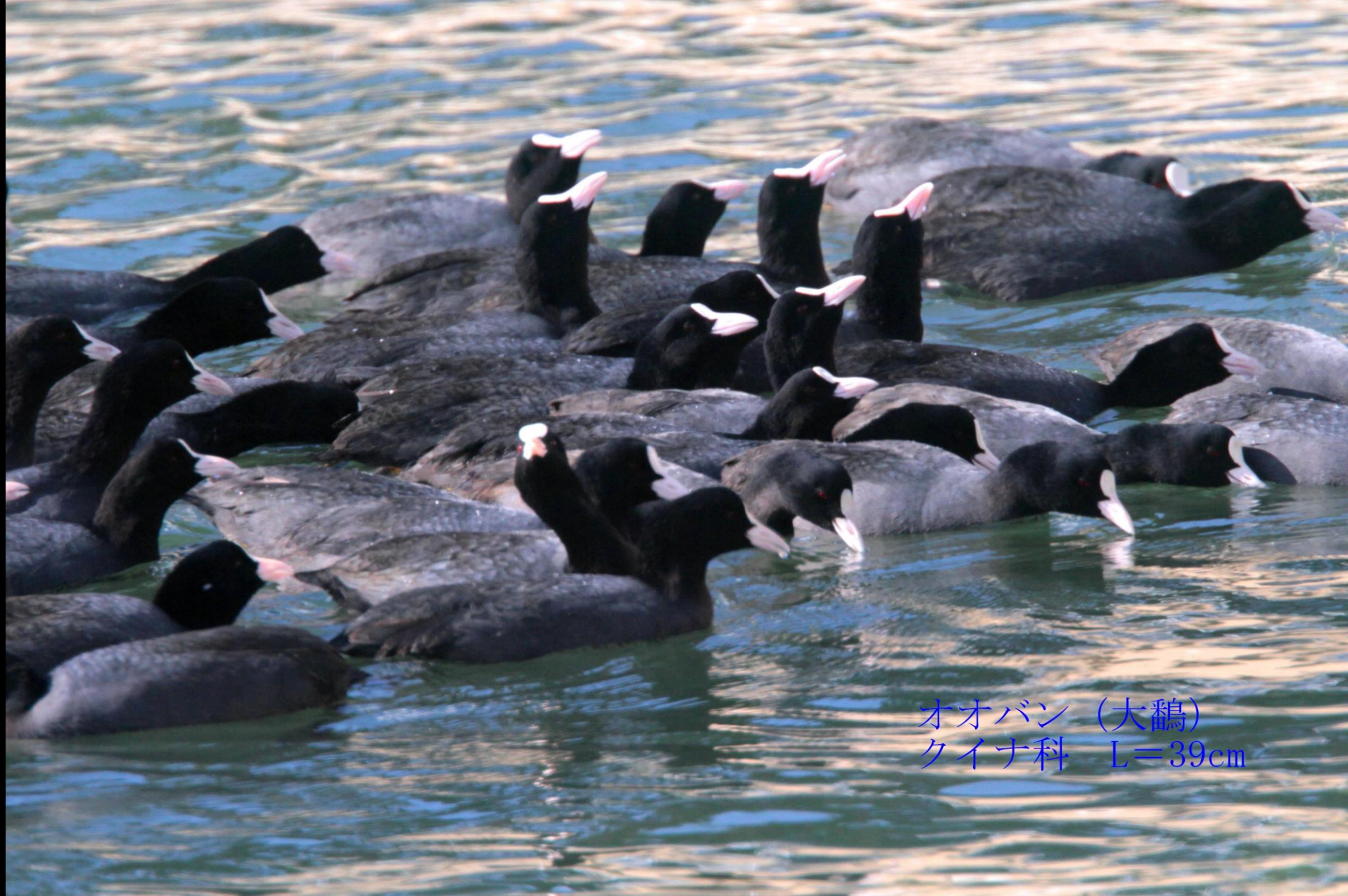
オオバン (大鵜) クイナ科 L=39cm