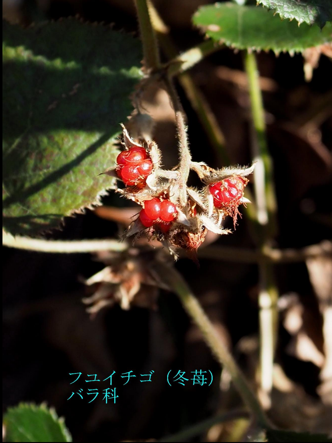
フユイチゴ (冬苺) バラ科