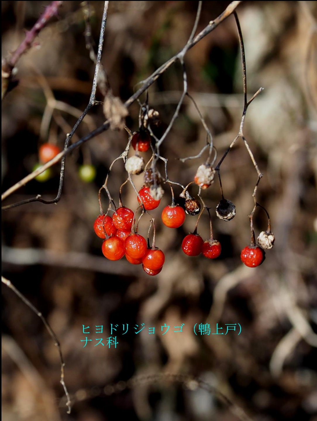
ヒヨドリジョウゴ (鴨上戸) ナス科