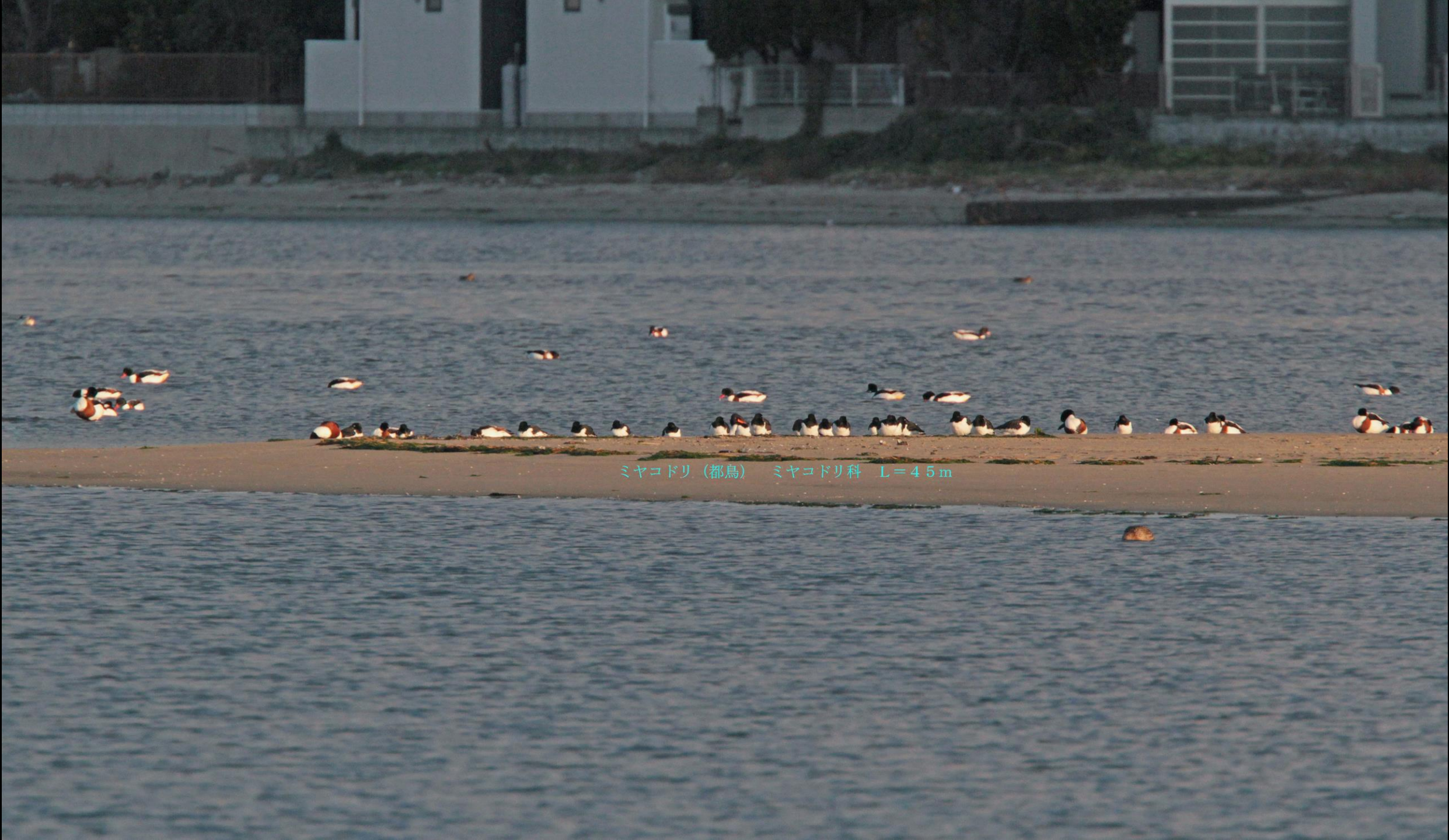
ミヤコドリ (都鳥) ミヤコドリ科 L=45m