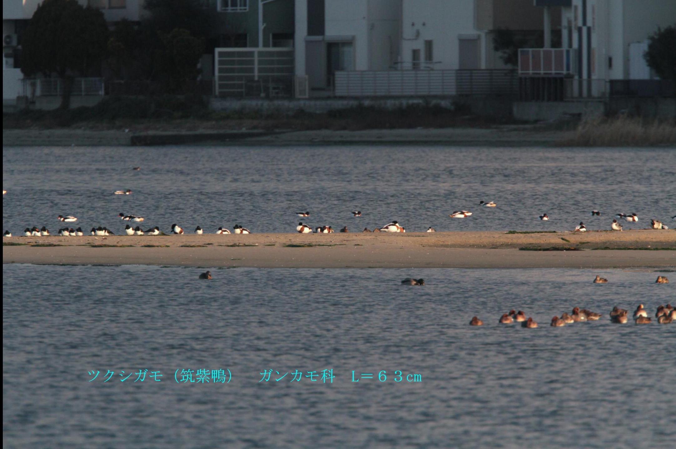
ツクシガモ (筑紫鴨) ガンカモ科 L=63cm