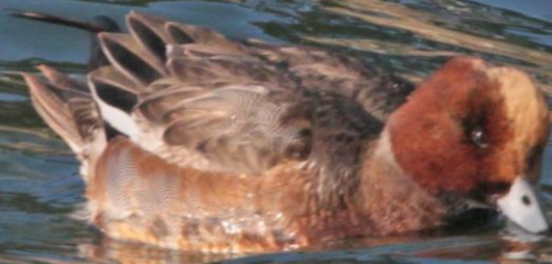
ヒドリガモ (緋鳥鴨) オス ガンカモ科 L=49cm