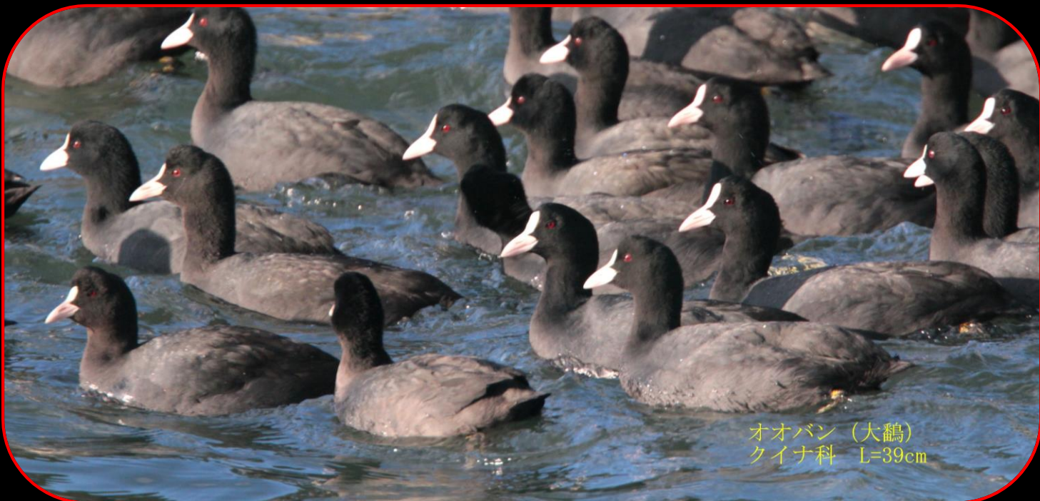
オオバン (大鵞) クイナ科 L=39cm