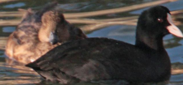
オオバン (大鵞) タイナ科 L=39cm