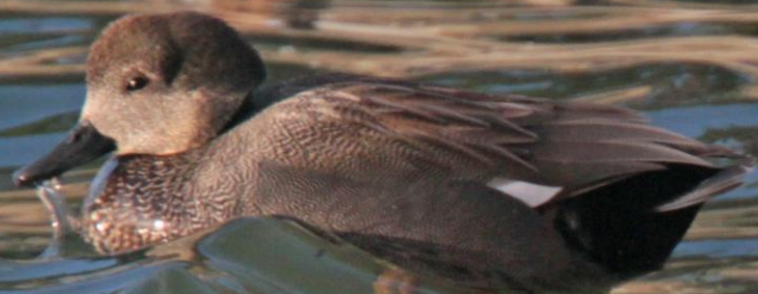
オカヨシガモ (丘葦鴨) オス ガンカモ科 L=50cm