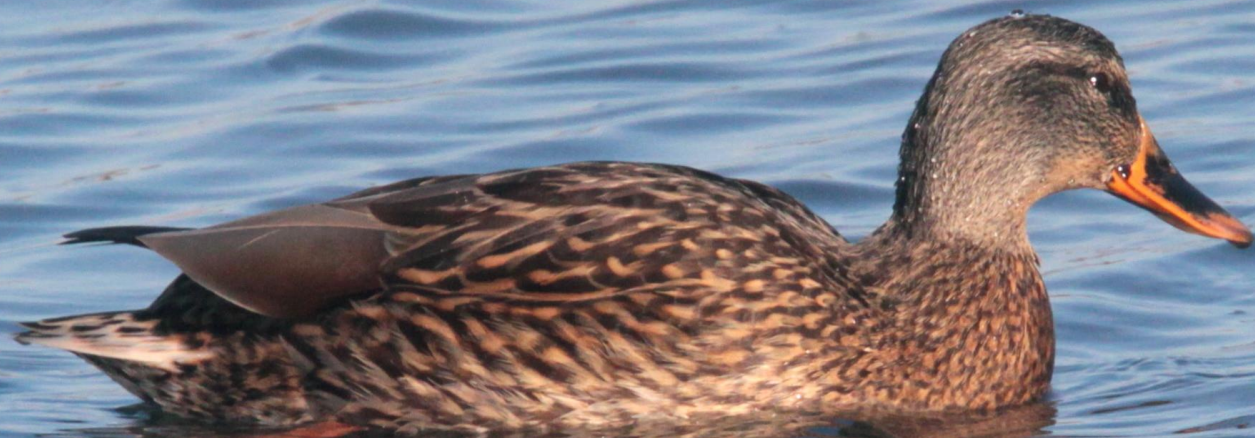
マガモ (真鴨) メス ガンカモ科 L=59cm