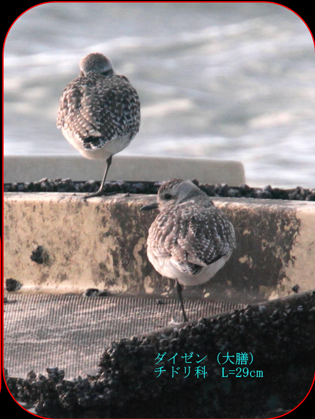
ダイゼン (大膳) チドリ科 L=29cm