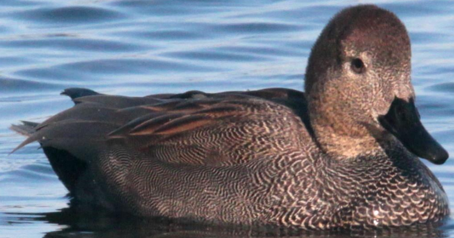
オカヨシガモ (丘葦鴨) オス ガンカモ科 L=50cm