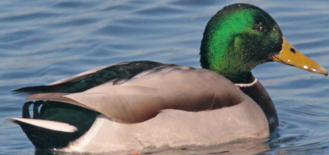
マガモ (真鴨) オス ガンカモ科 L=59cm