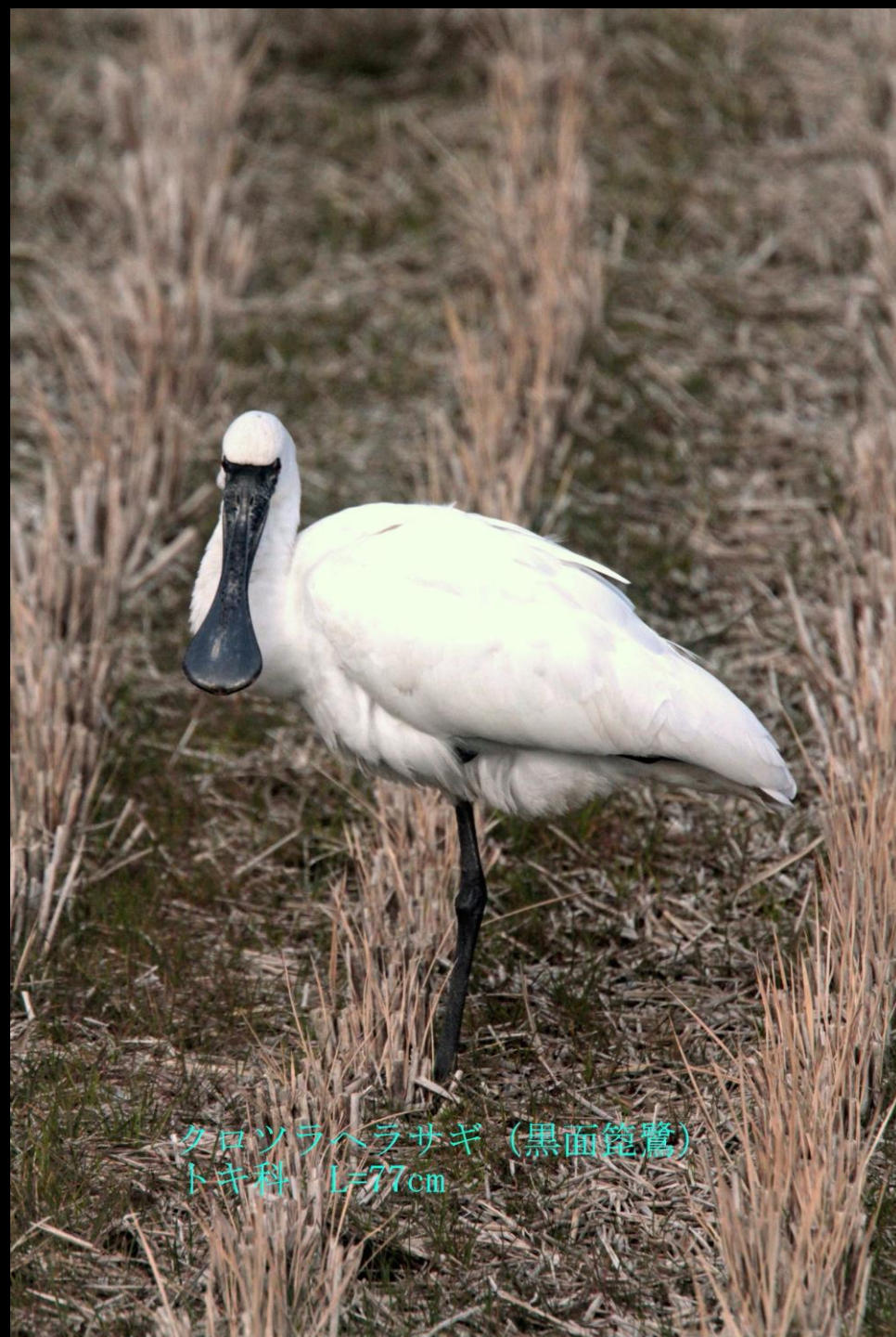
クロツラヘラサギ (黒面籠鷺) トキ科 L=77cm