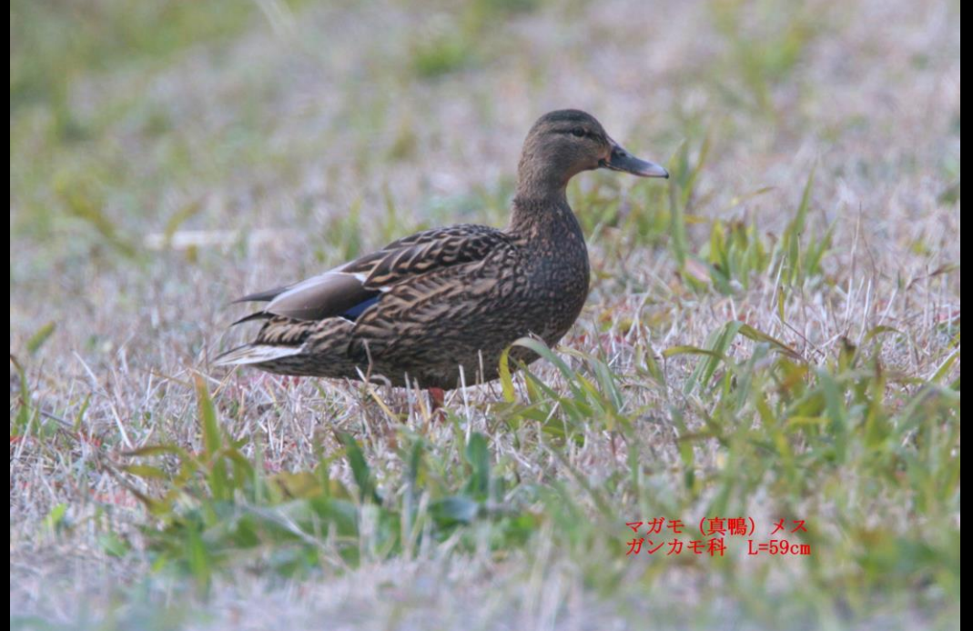
マガモ (真鴨) メス ガンカモ科 L=59cm