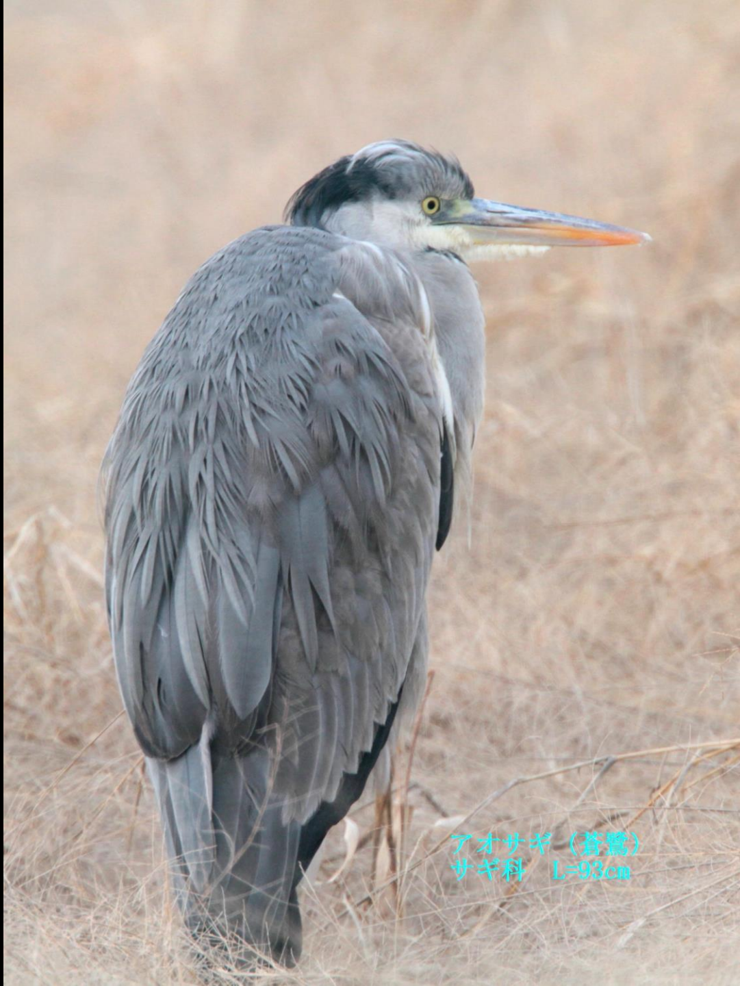
アオサギ (蒼鷺) サギ科 L=93cm