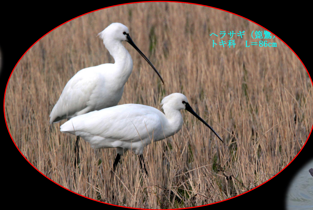
ヘラサギ (篋鷺) トキ科 L=86cm