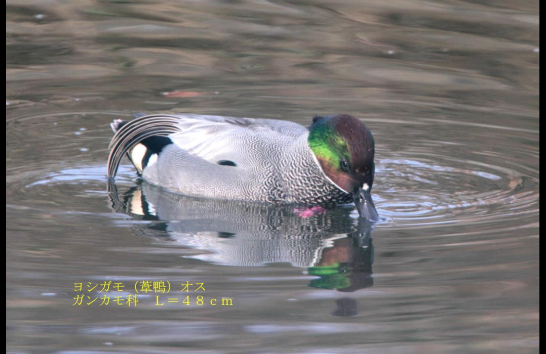
ヨシガモ (葦鴨) オス ガンカモ科 L=48cm