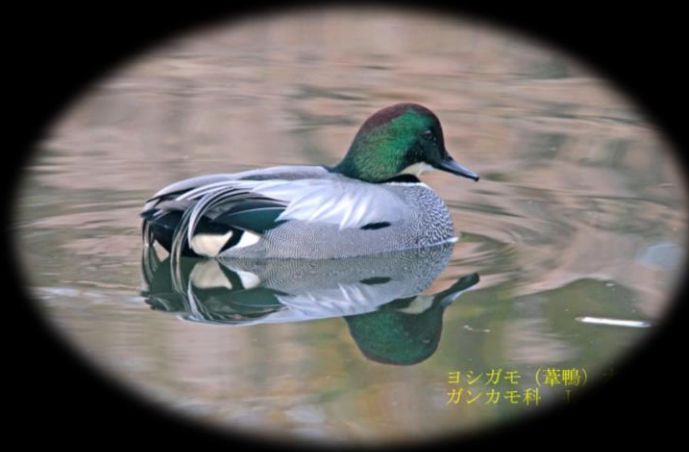
ヨシガモ (葦鴨) ガンカモ科