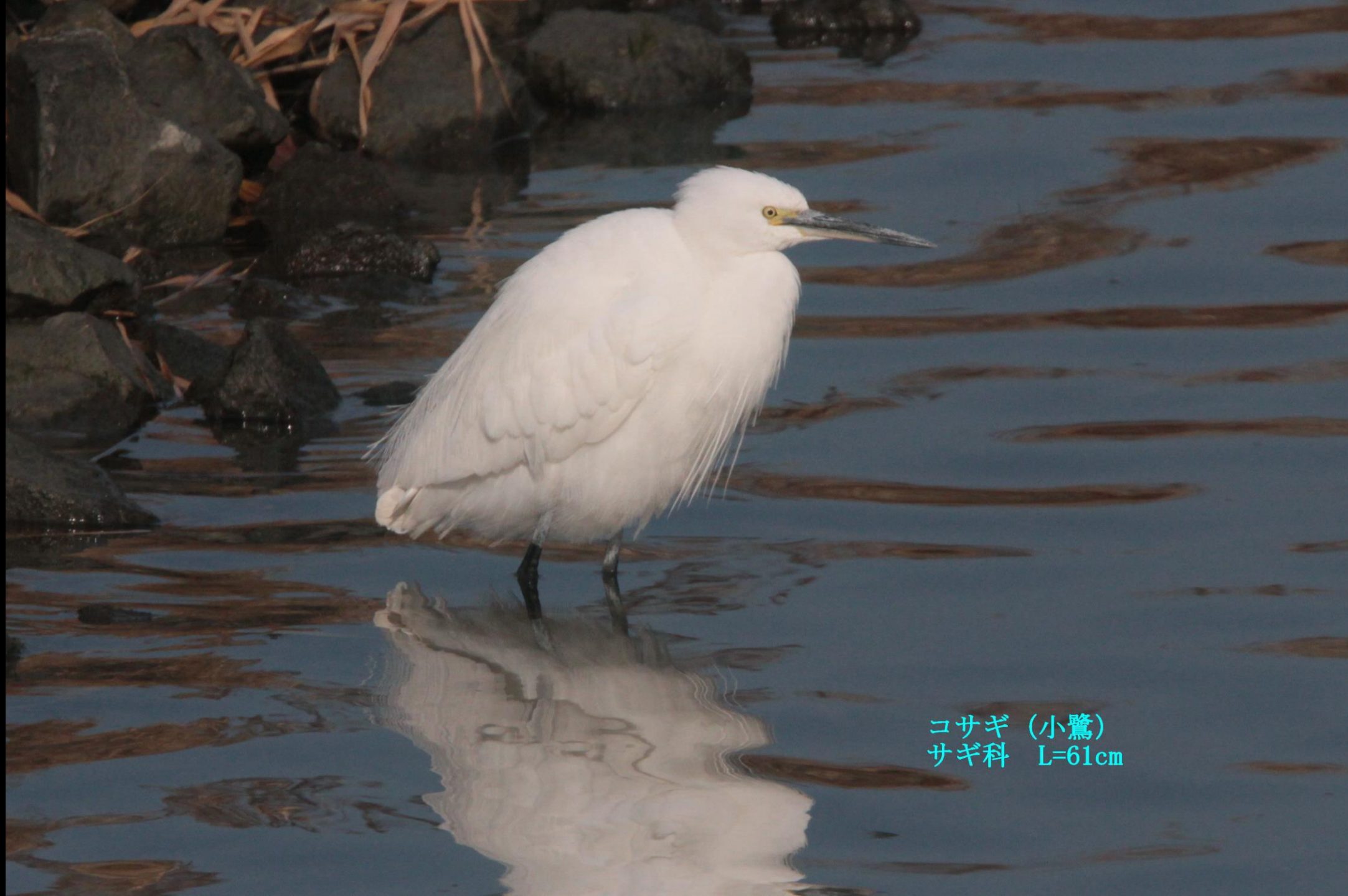
コサギ (小鷺) サギ科 L=61cm