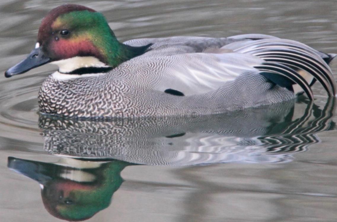
ヨシガモ（葦鴨）オス ガンカモ科 L=48cm