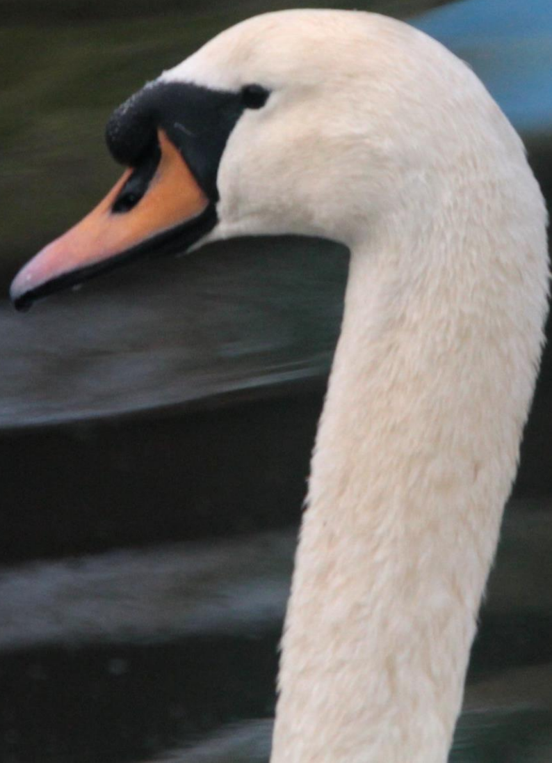
コブハクチョウ (瘤白鳥) ガンカモ科 L = 152 cm