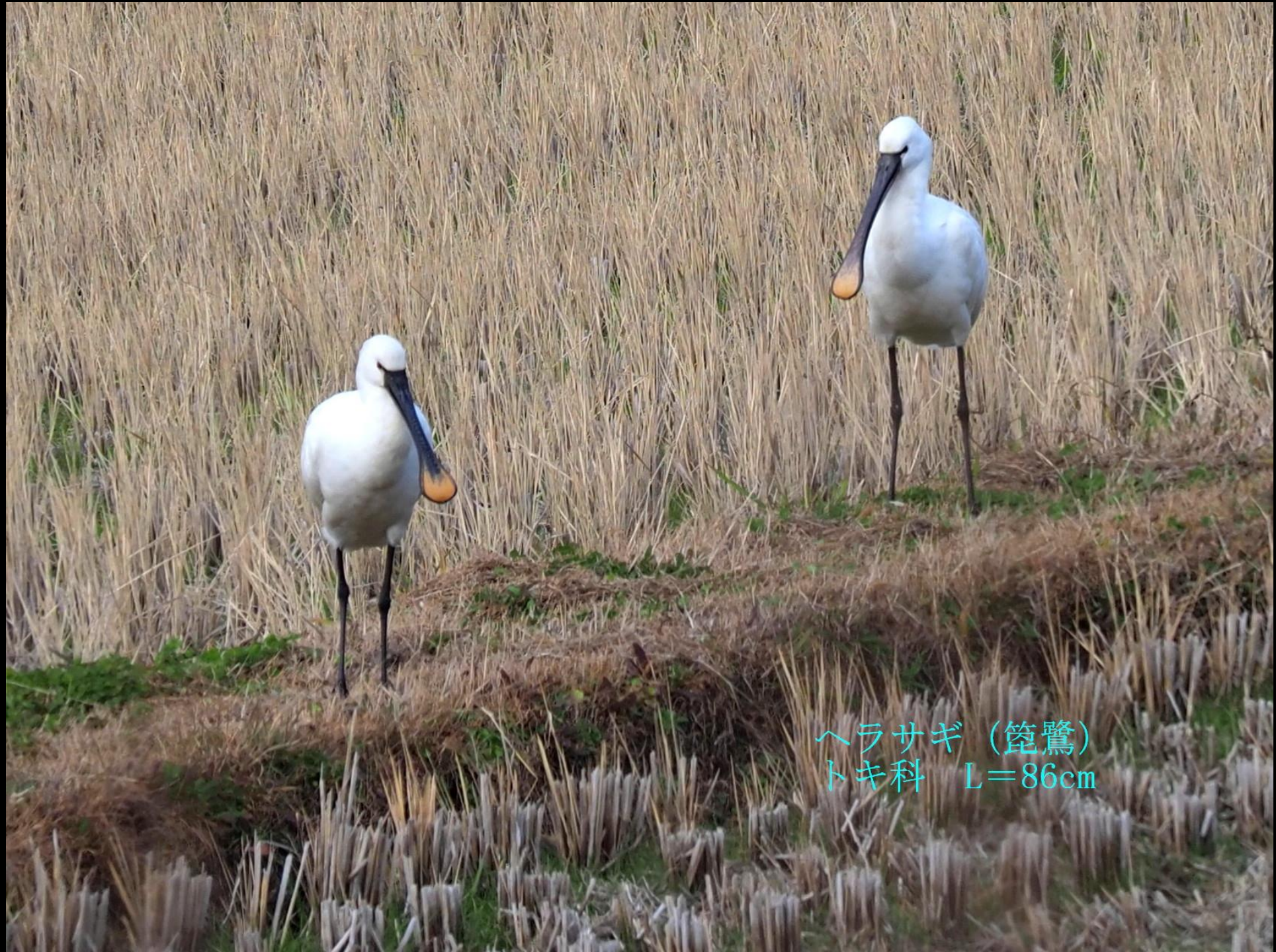
ヘラサギ (篋鷺) トキ科 L=86cm