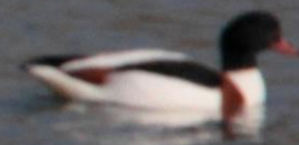
ツクシガモ (筑紫鴨) ガンカモ科 L=63cm