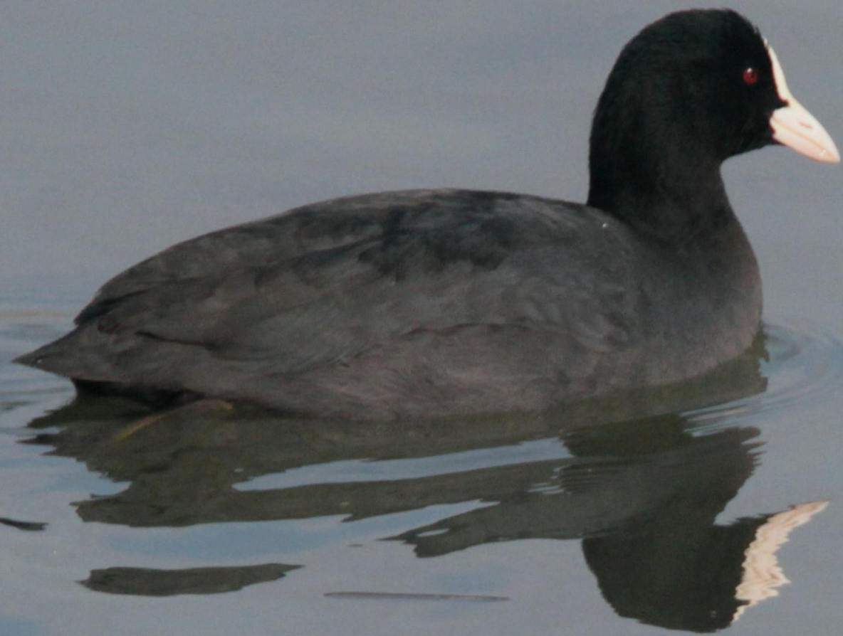
オオバン (大鵞) クイナ科 L=39cm