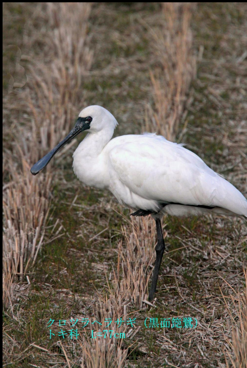
クロツラヘラサギ (黒面籠鷺) トキ科 L=77cm