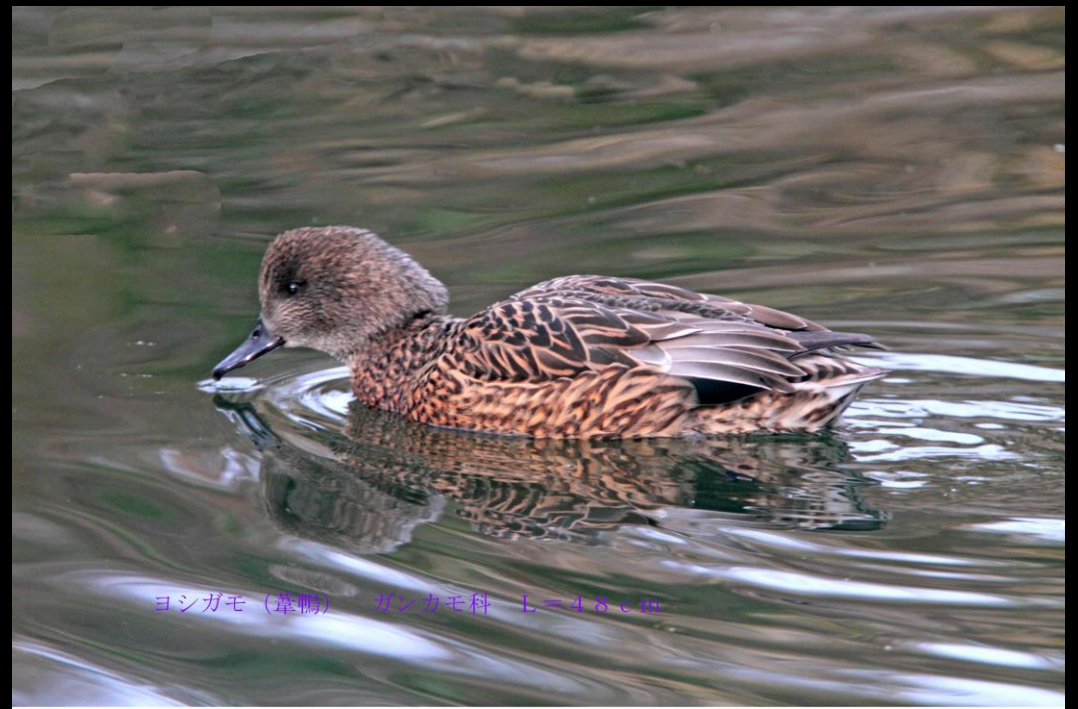
ヨシガモ (葦鴨) ガンカモ科 L=48cm