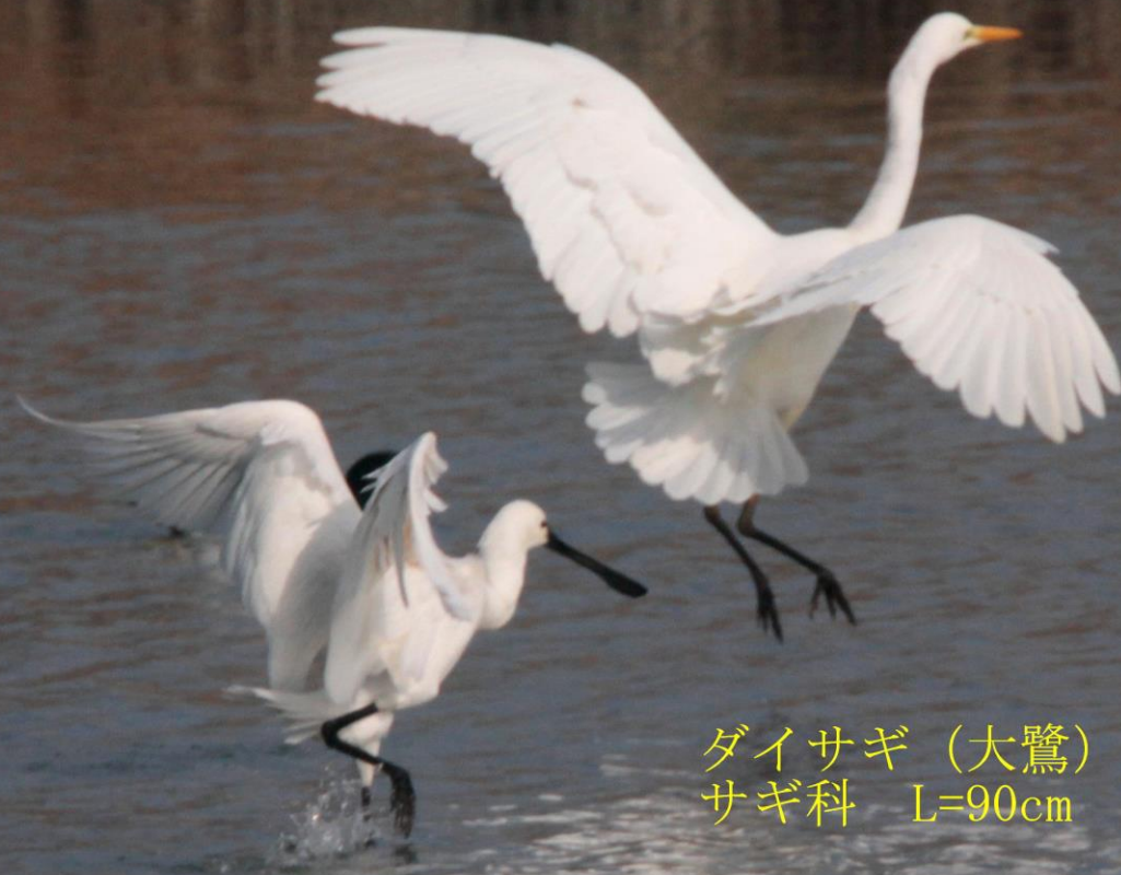
ダイサギ (大鷺) サギ科 L=90cm