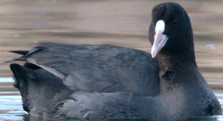
オオバン (大鵞) クイナ科 L = 39 cm