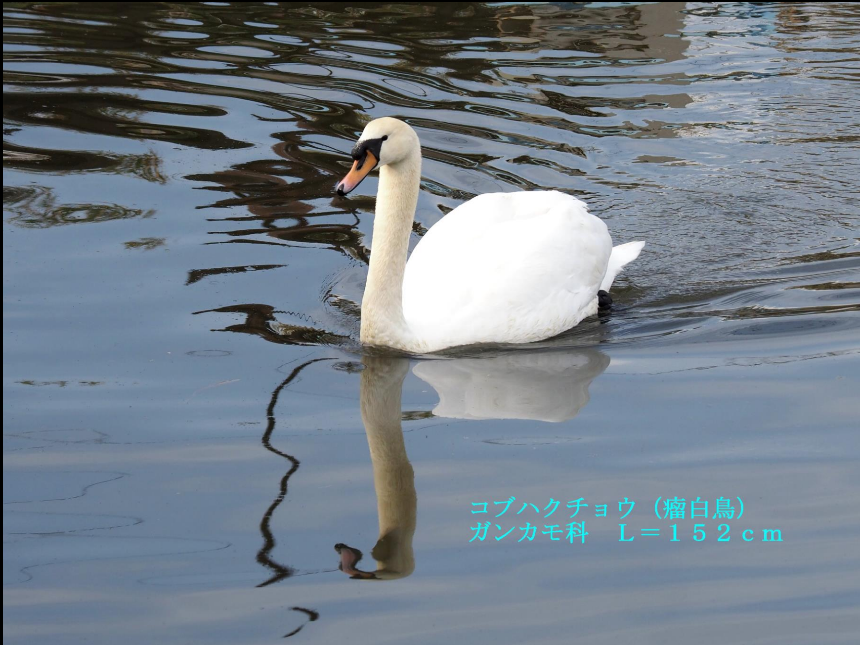
コブハクチョウ (瘤白鳥) ガンカモ科 L=152cm