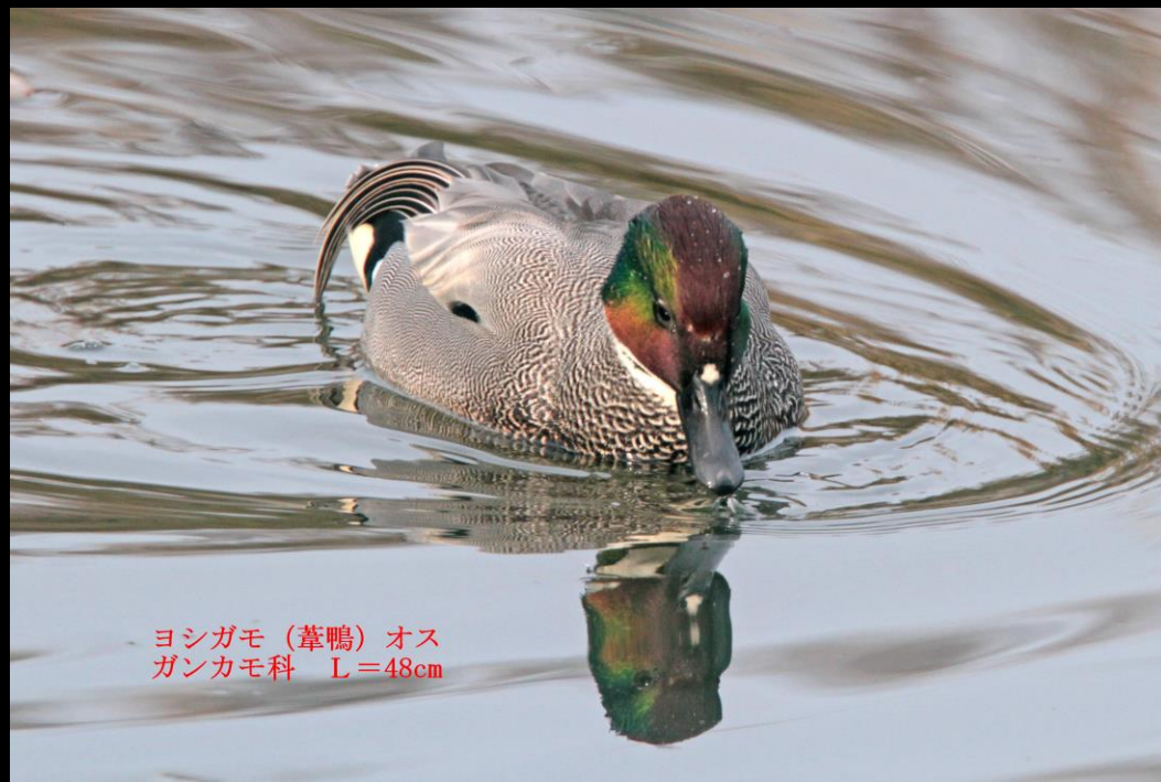
ヨシガモ (葦鴨) オス ガンカモ科 L=48cm