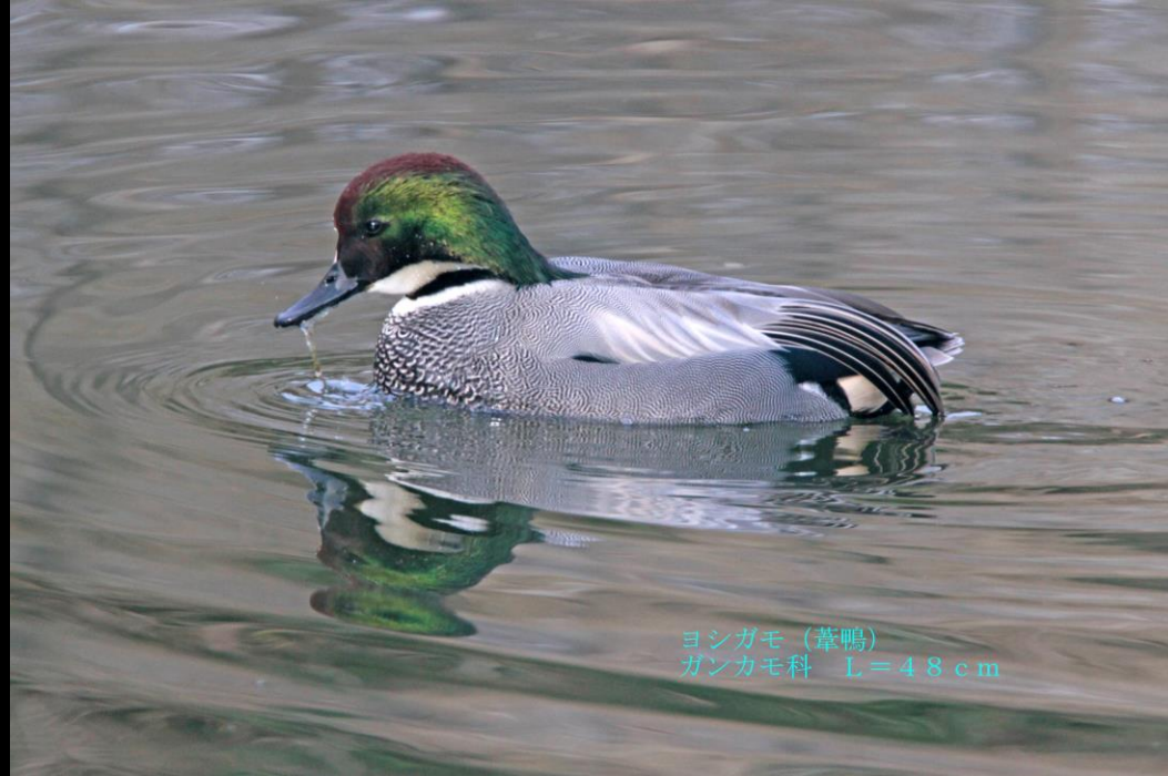
ヨシガモ (葦鴨) ガンカモ科 L=48cm