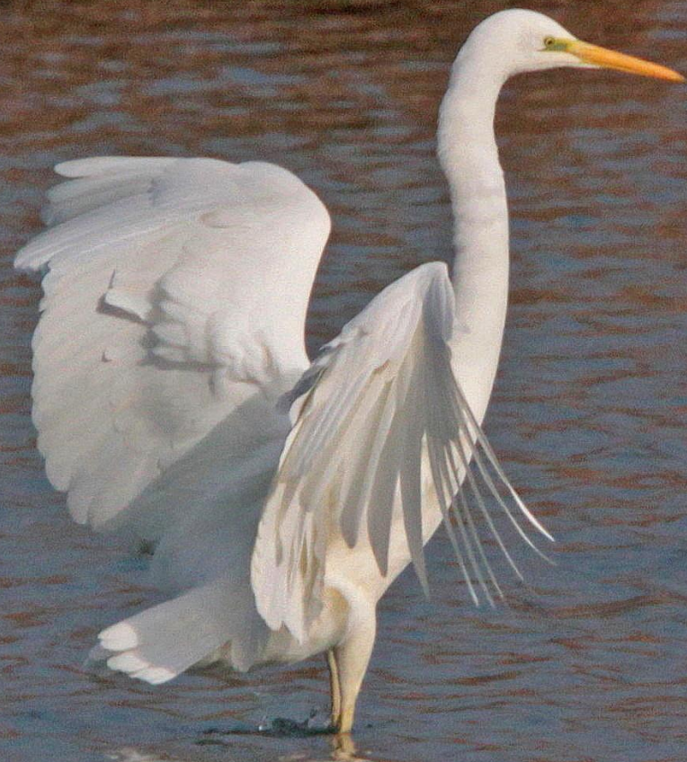
ダイサギ (大鷺) サギ科 L=90cm