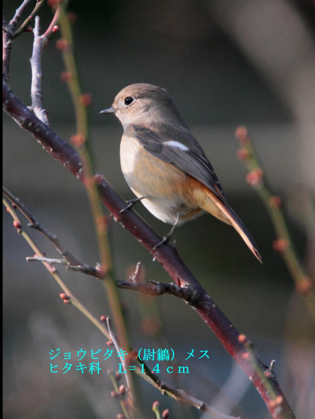
ジョウビタキ (尉鶺) メス ヒタキ科 L=14 cm