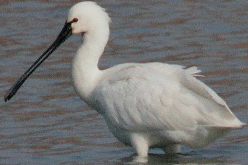
ヘラサギ (篋鷺) トキ科 L=86cm