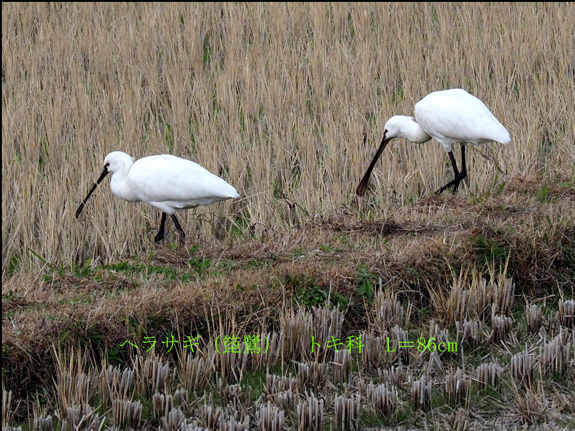
ヘラサギ (篋鷺) トキ科 L=86cm