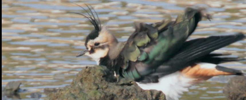
タゲリ (田鳥) チドリ科 L=82cm