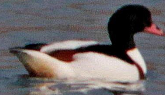
ミヤコドリ (都鳥) ミヤコドリ科 L=45cm