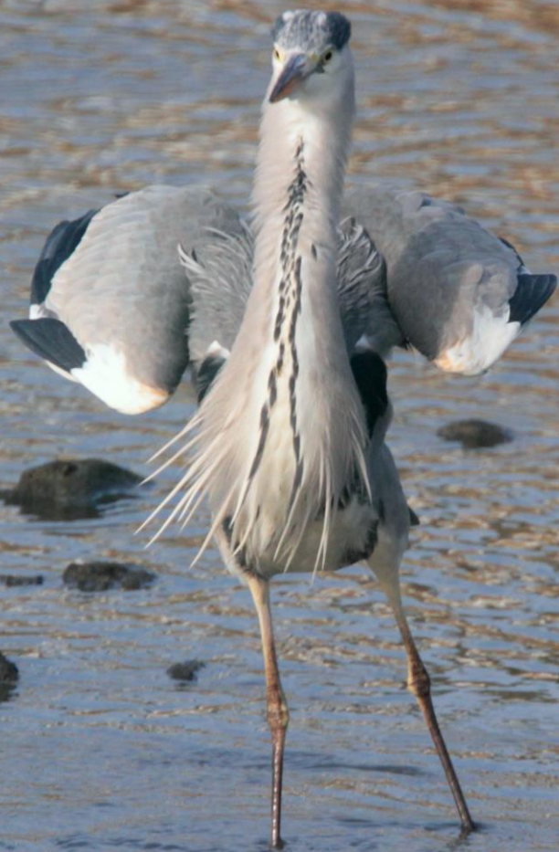
アオサギ (蒼鷺) サギ科 L=93cm