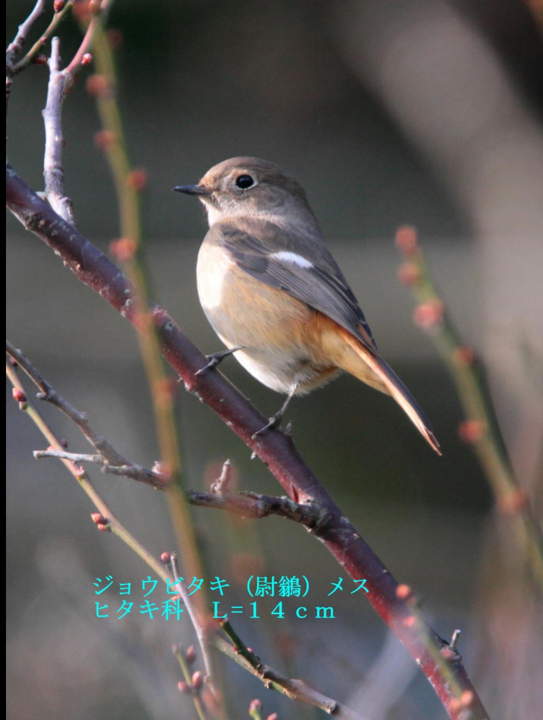
ジョウビタキ (尉鶺) メス ヒタキ科 L=14 cm