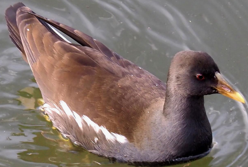
バン (鵜) クイナ科 L=32cm