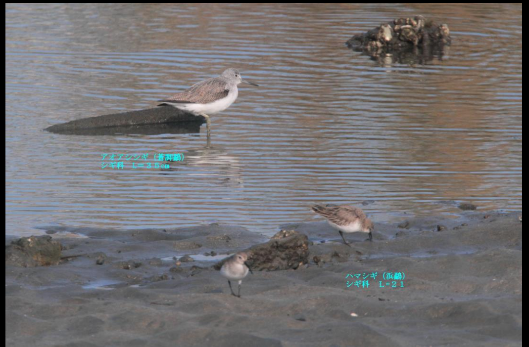
アオアシナギ (蒼脚鷸) シギ科 L=33cm