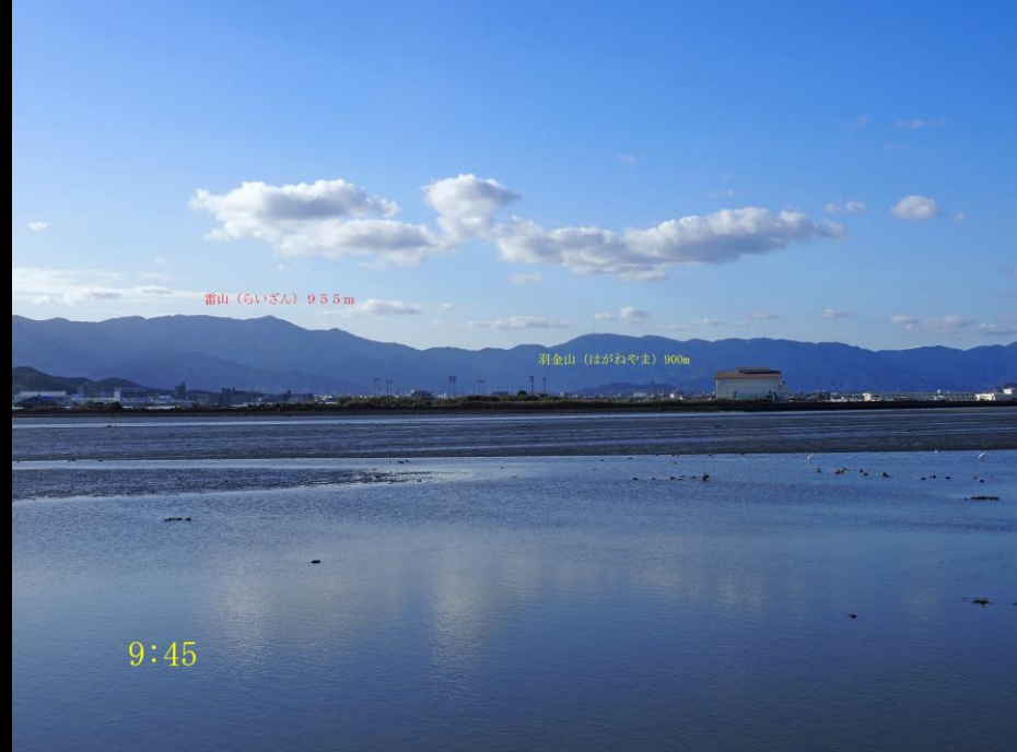
番山 (らいざん) 95.5m