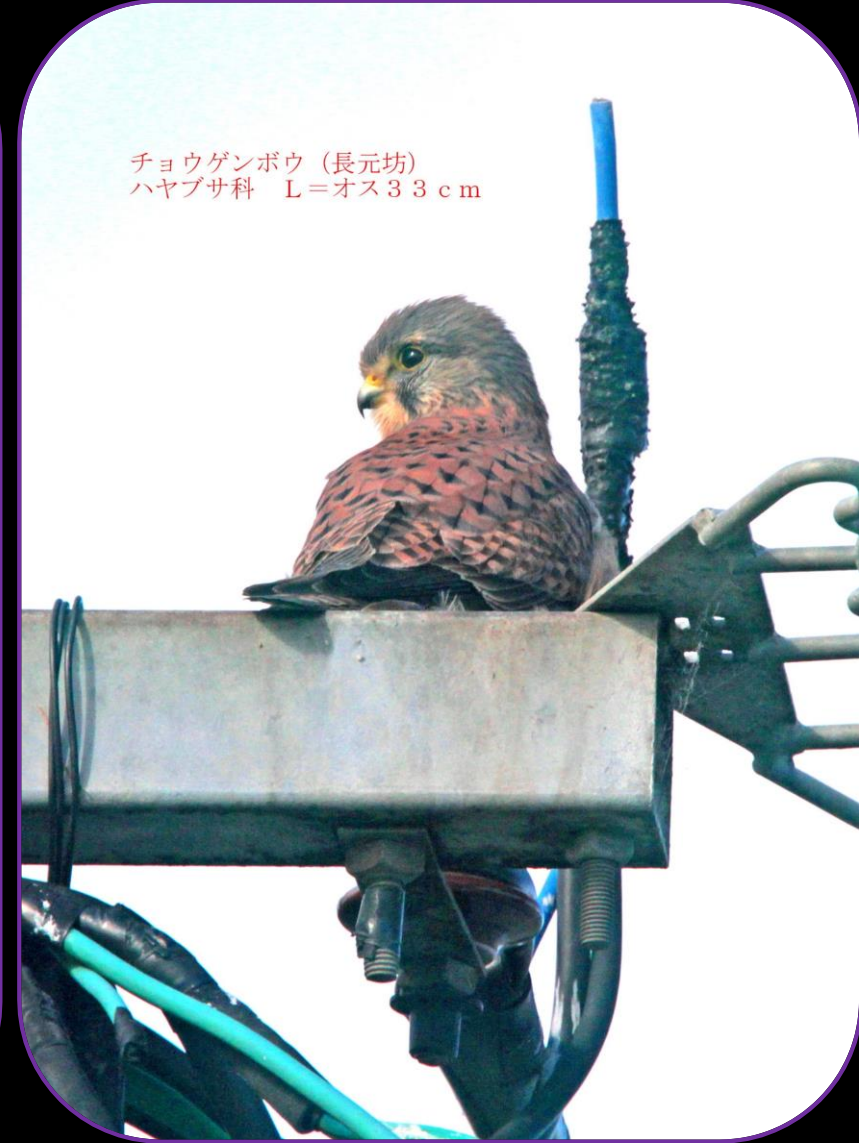
チョウゲンボウ (長元坊) ハヤブサ科 L=オス33cm