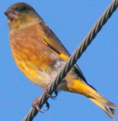
カワラヒワ (河原鶉) オス アトリ科 L=14.5cm