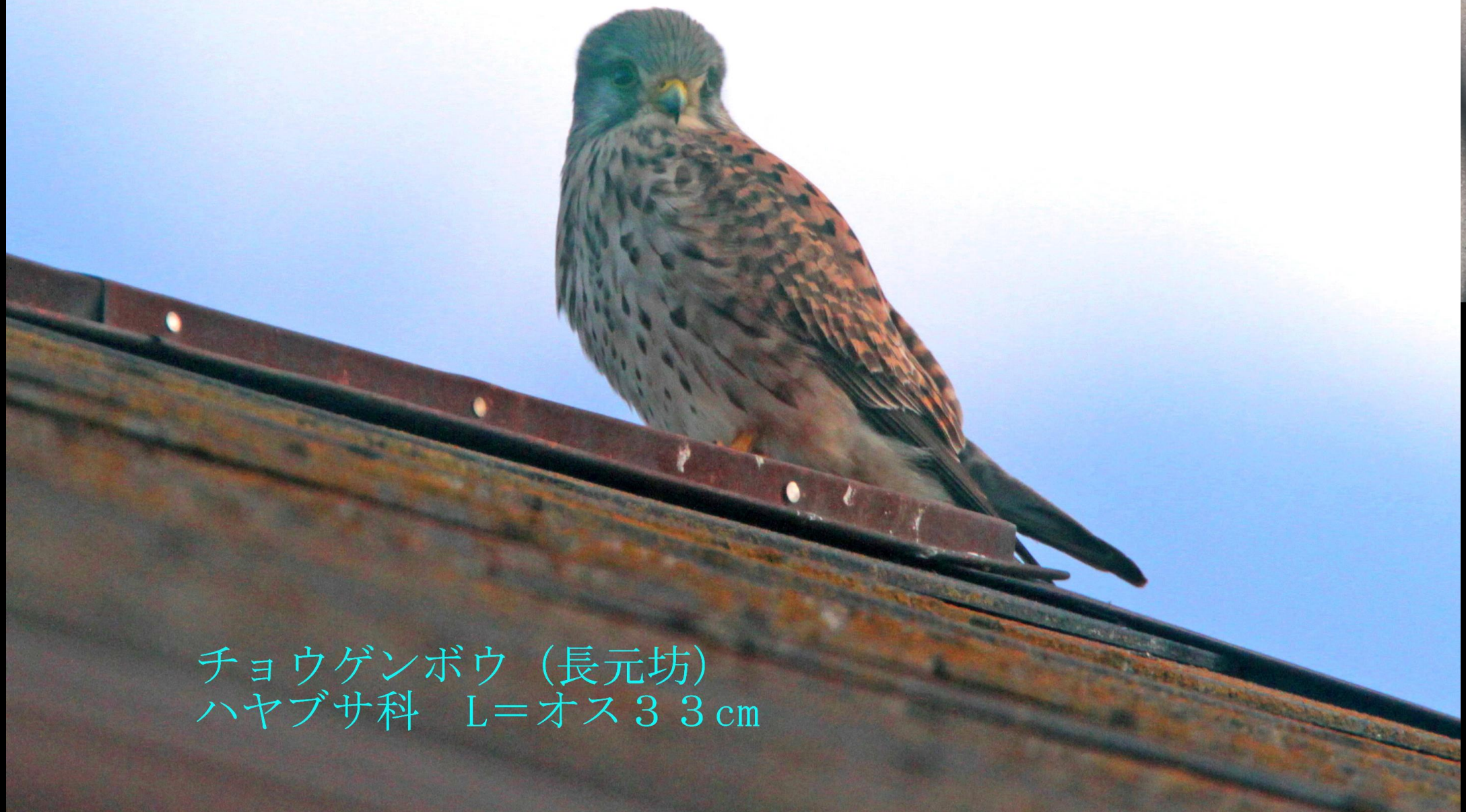
チョウゲンボウ (長元坊) ハヤブサ科 L=オス 33 cm