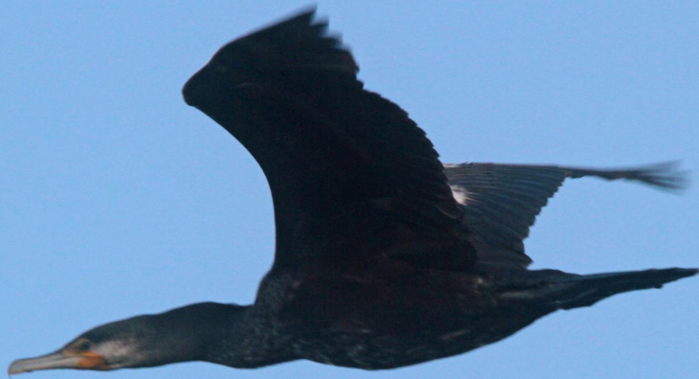
カワウ（河鵜） ウ科 L=82cm