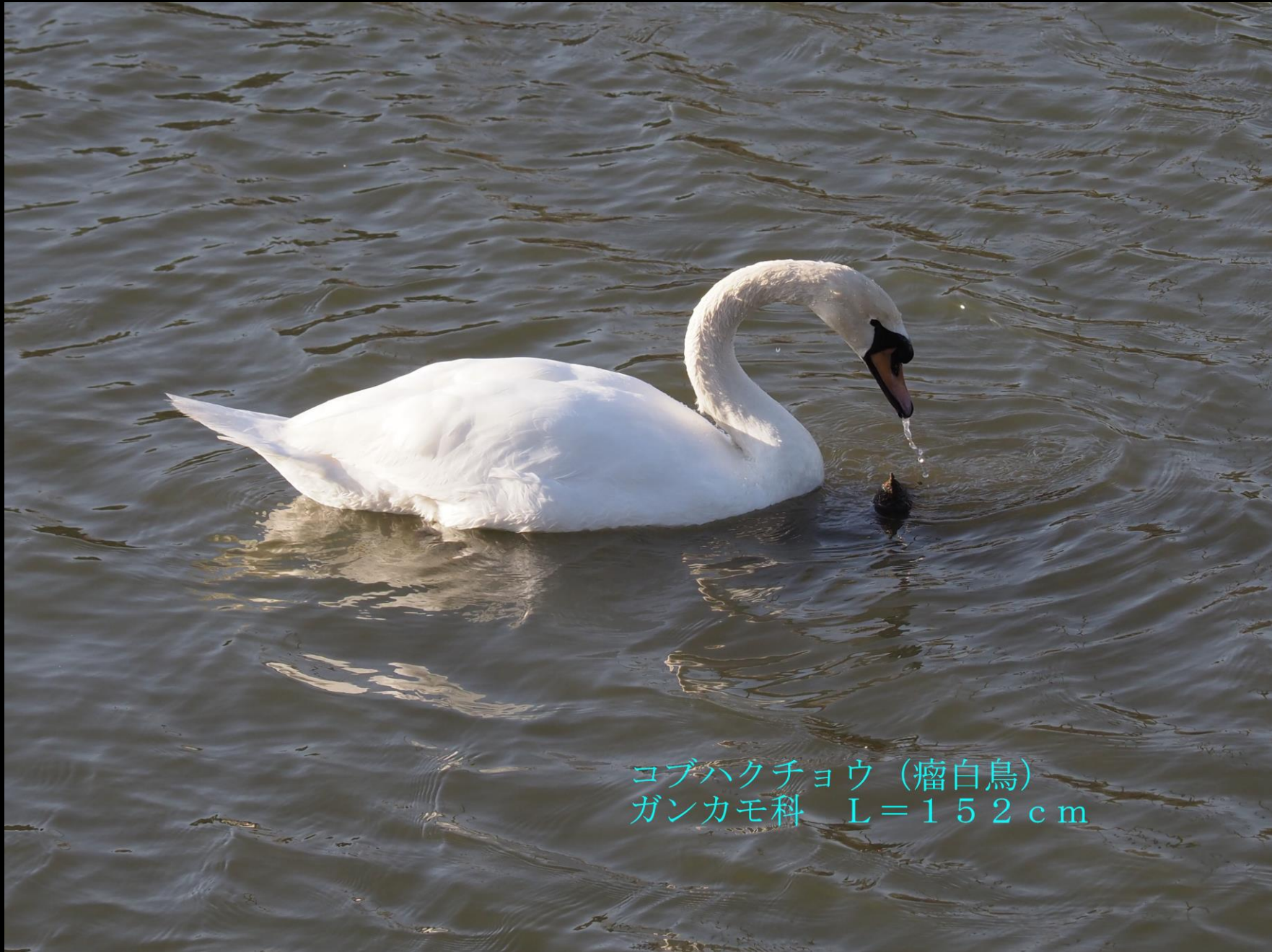
ヨブハクチョウ (瘤白鳥) ガンカモ科 L=152cm