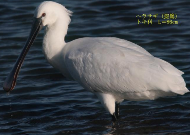
ヘラサギ (鉈鷺) トキ科 L=86cm