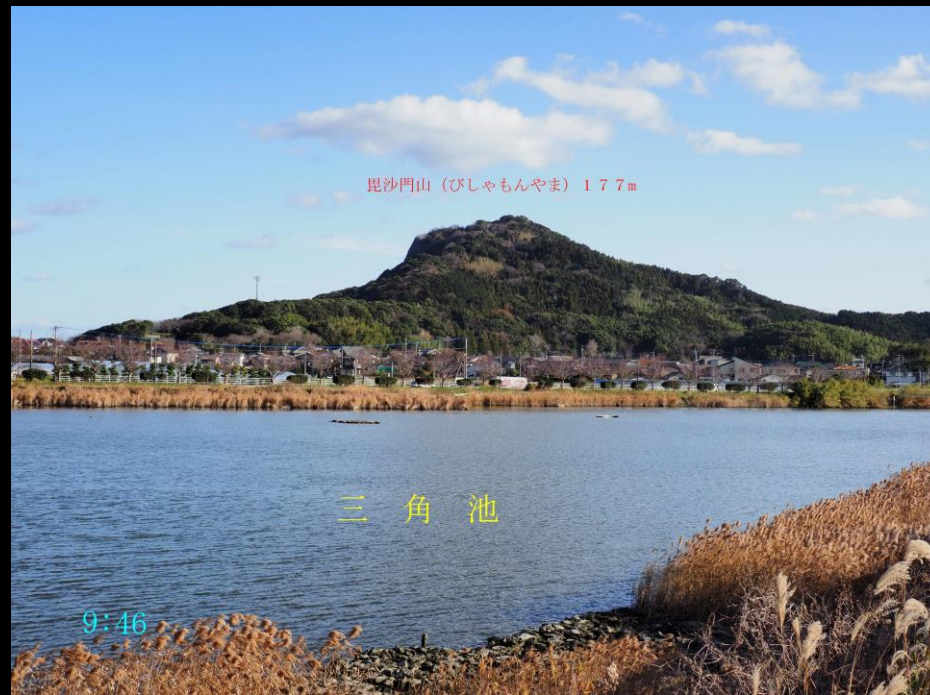
毘沙門山 (びしゃもんやま) 177m