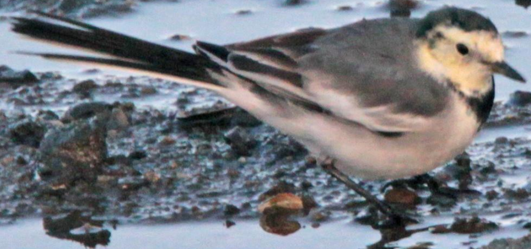
ハクセキレイ (白鶺鴒) セキレイ科 L = 21 cm