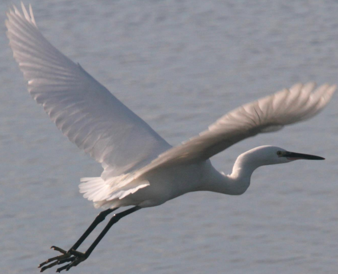
ダイサギ (大鷺) サギ科 L=90cm