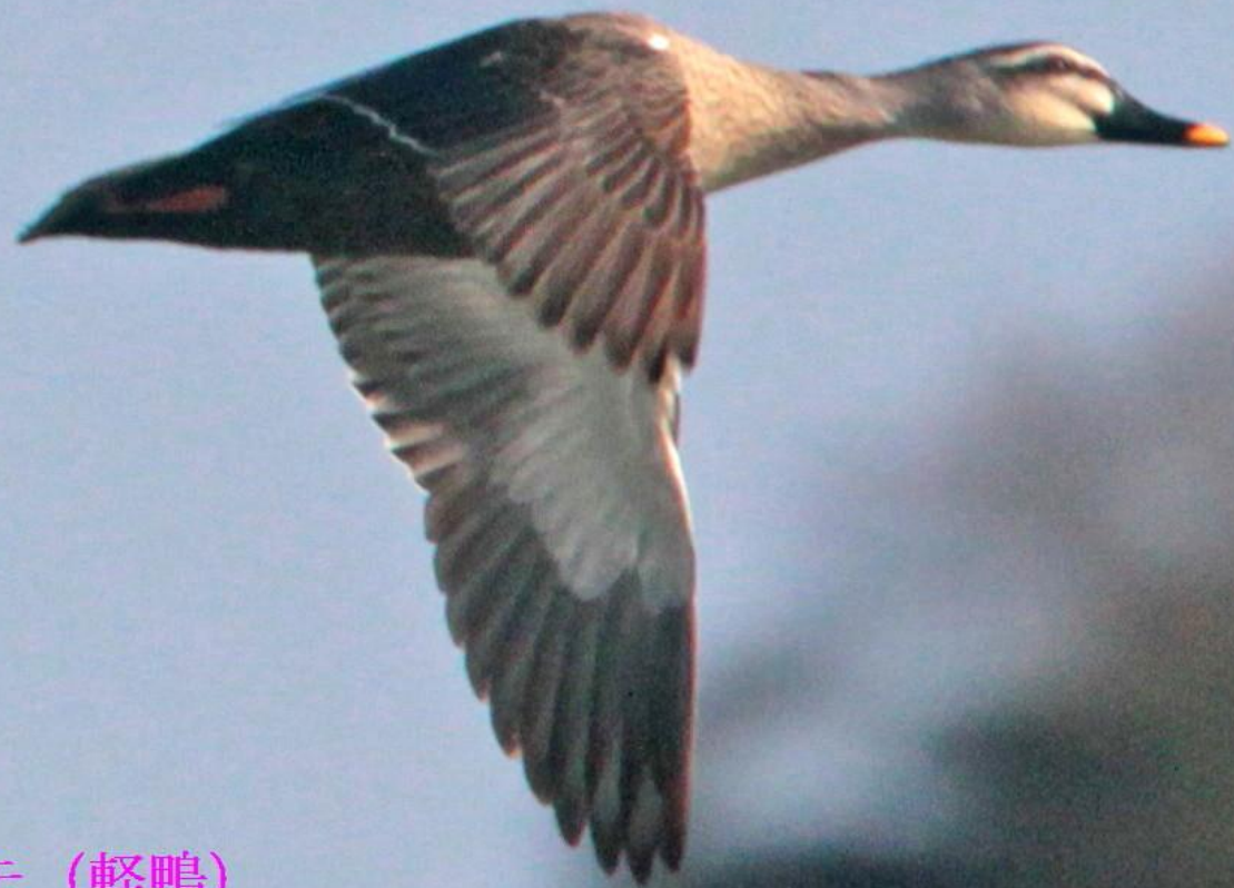
カルガモ (軽鴨) ガンカモ科 L=61cm