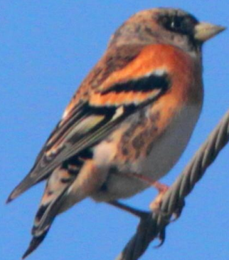
アトリ(花鶉) オス アトリ科 L=16cm