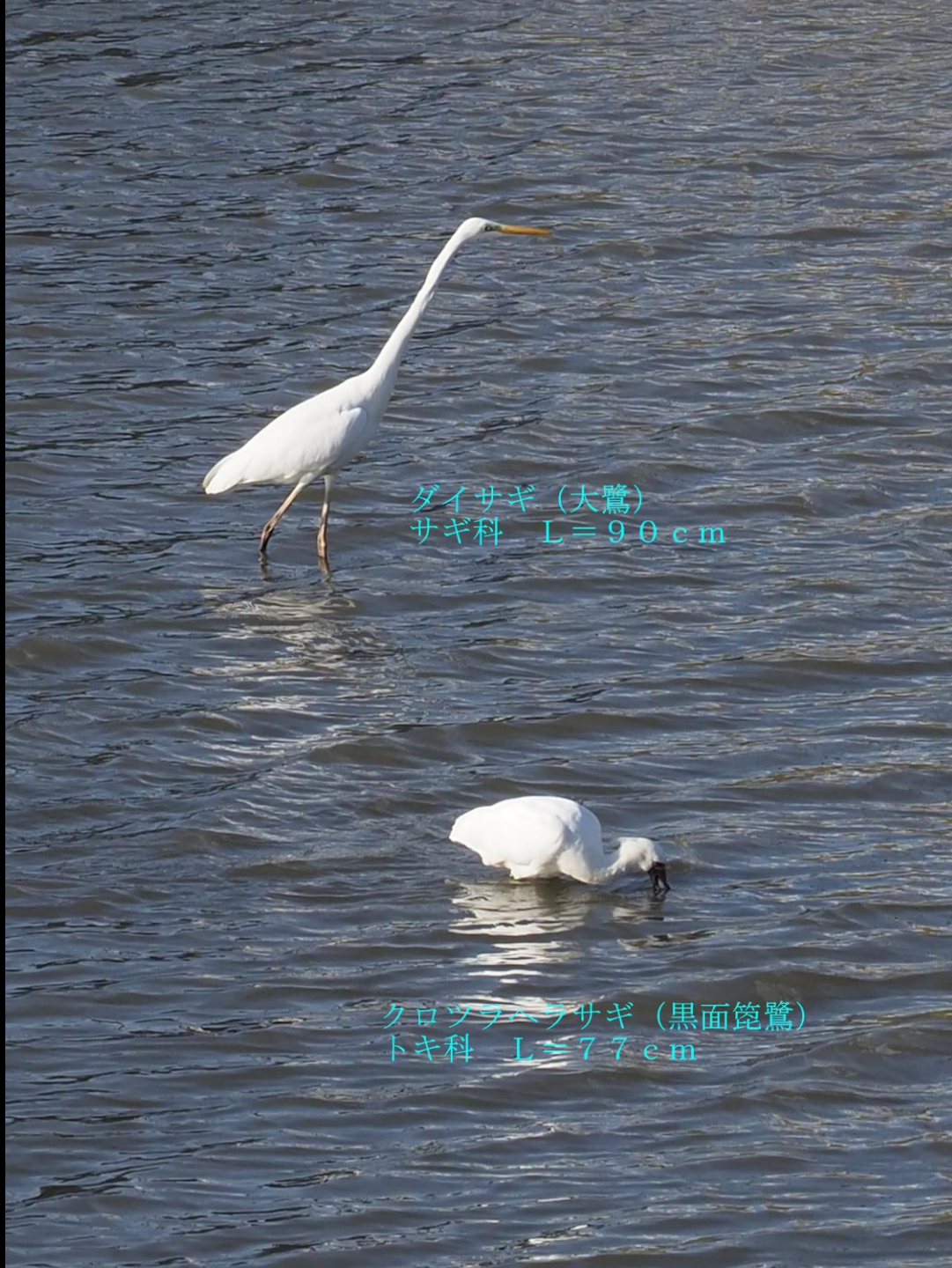
ダイサギ (大鷺) サギ科 L=90cm