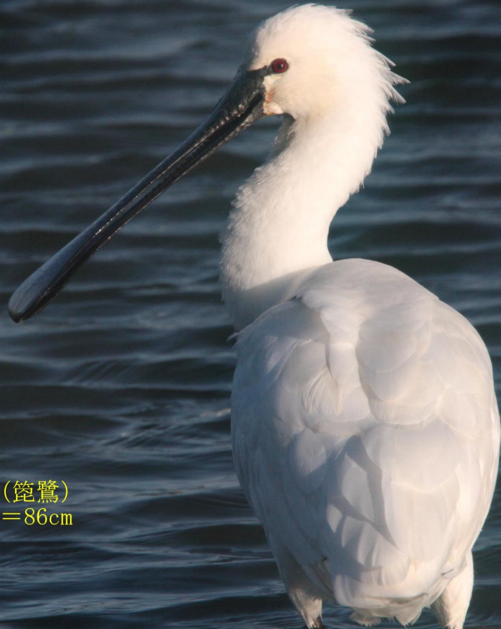
ヘラサギ (篋鷺) トキ科 L=86cm