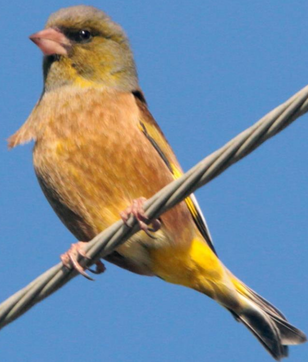
カワラヒワ (河原鶇) アトリ科 L=14.5 c m