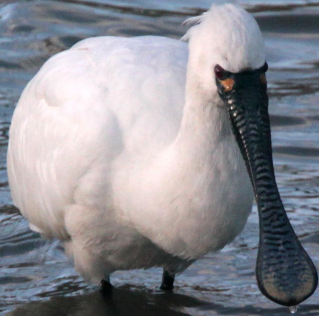
クロツラヘラサギ (黒面篋鷺) トキ科 L=77cm