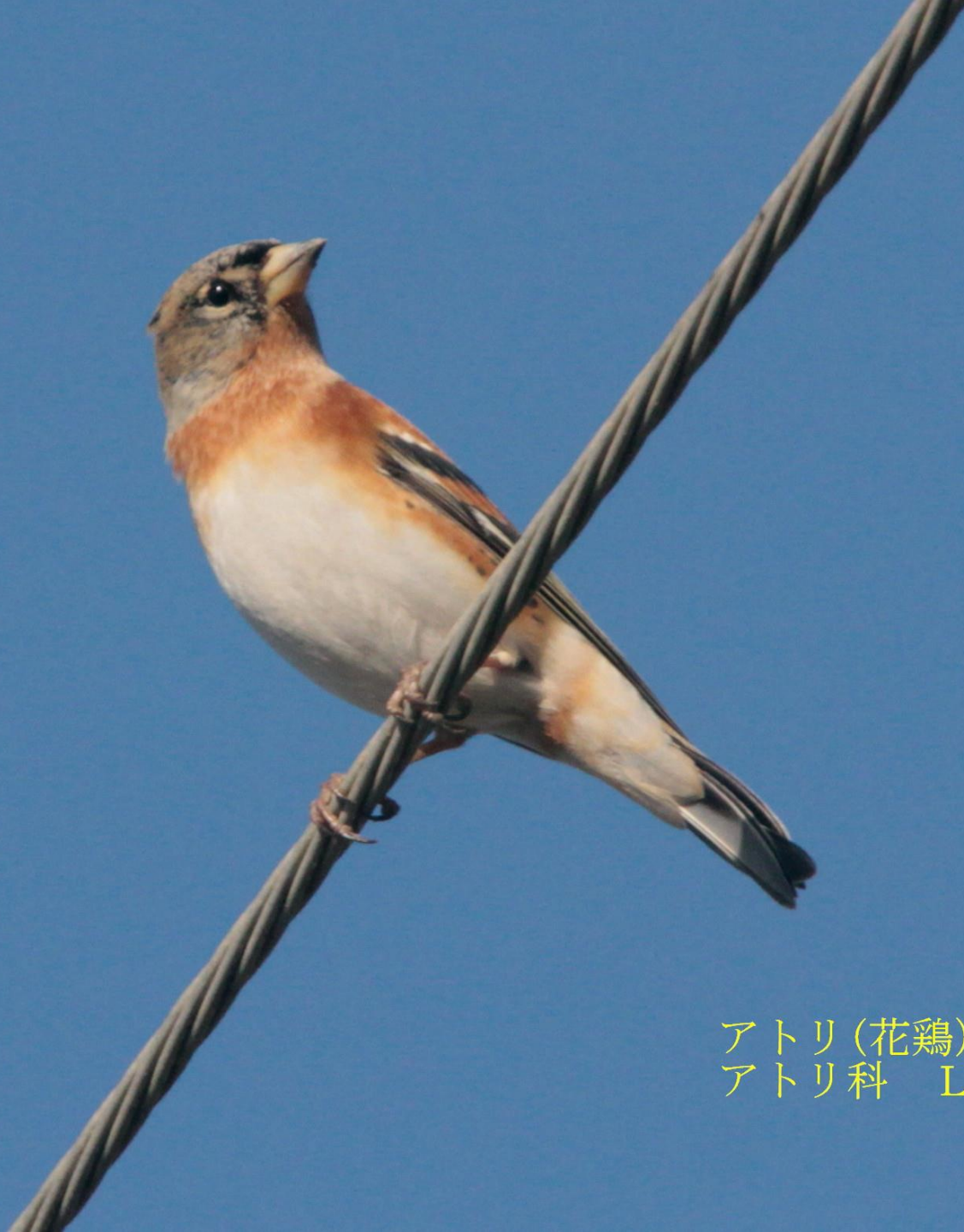
アトリ(花鶏) オス アトリ科 L=16cm