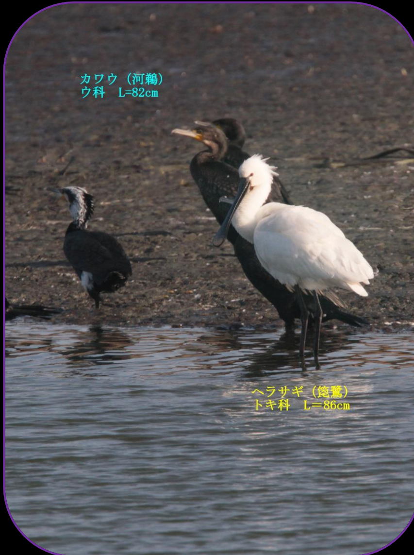
カワウ (河鵜) ウ科 L=82cm