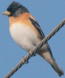
アトリ (花鷲) オス アトリ科 L=16cm