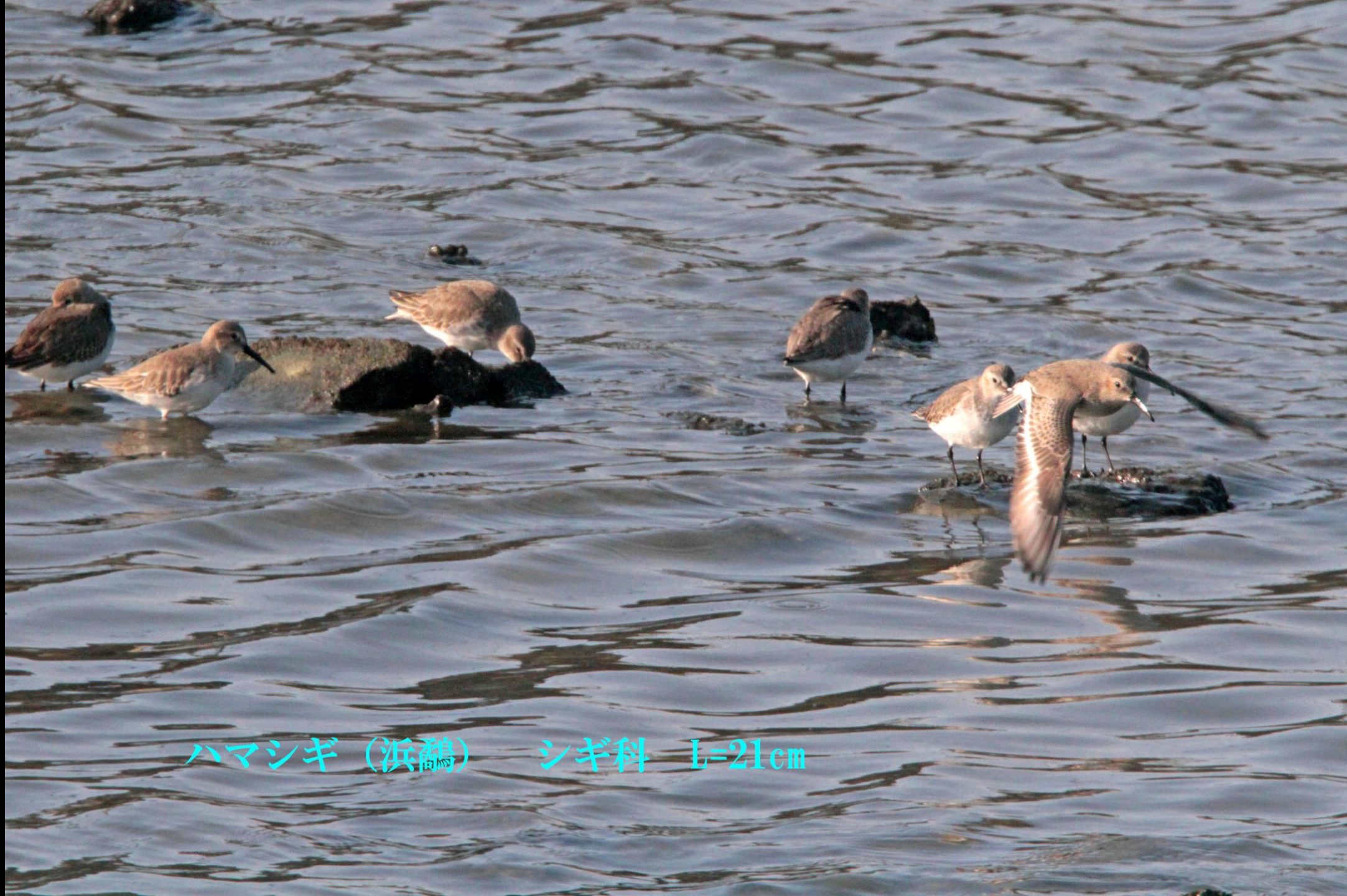
ハマシギ (滨鹬) シギ科 L=21cm