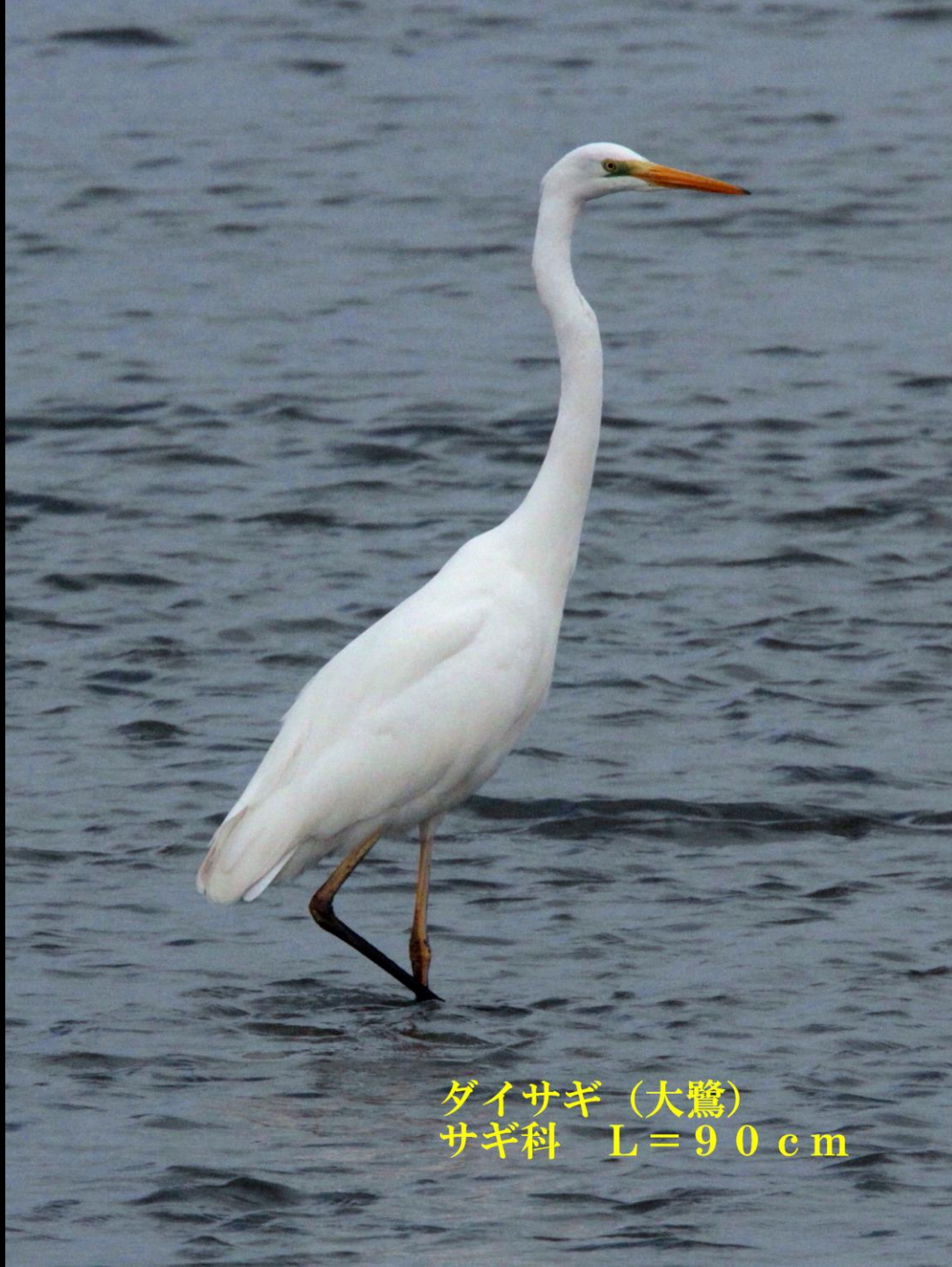
ダイサギ (大鷺) サギ科 L=90 cm