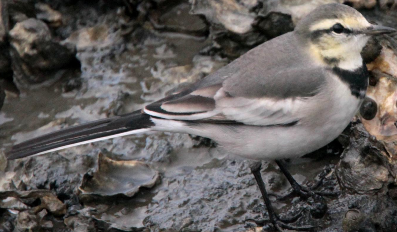
ハクセキレイ (白鶺鴒) セキレイ科 L = 21 cm