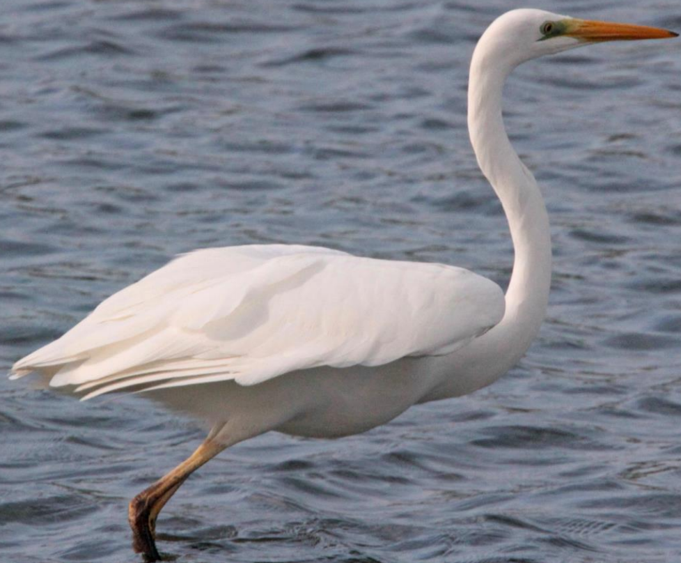
ダイサギ (大鷺) サギ科 L = 90 cm