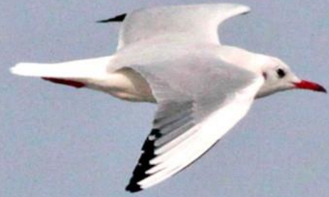
ユリカモメ (百合鷗) カモメ科 L = 40 cm