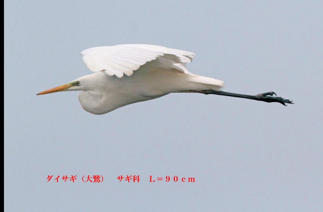
ダイサギ (大鷺) サギ科 L=90 cm