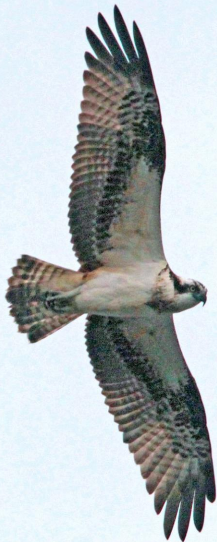
ミサゴ (鵟) ワシタカ科 L=メス64cm