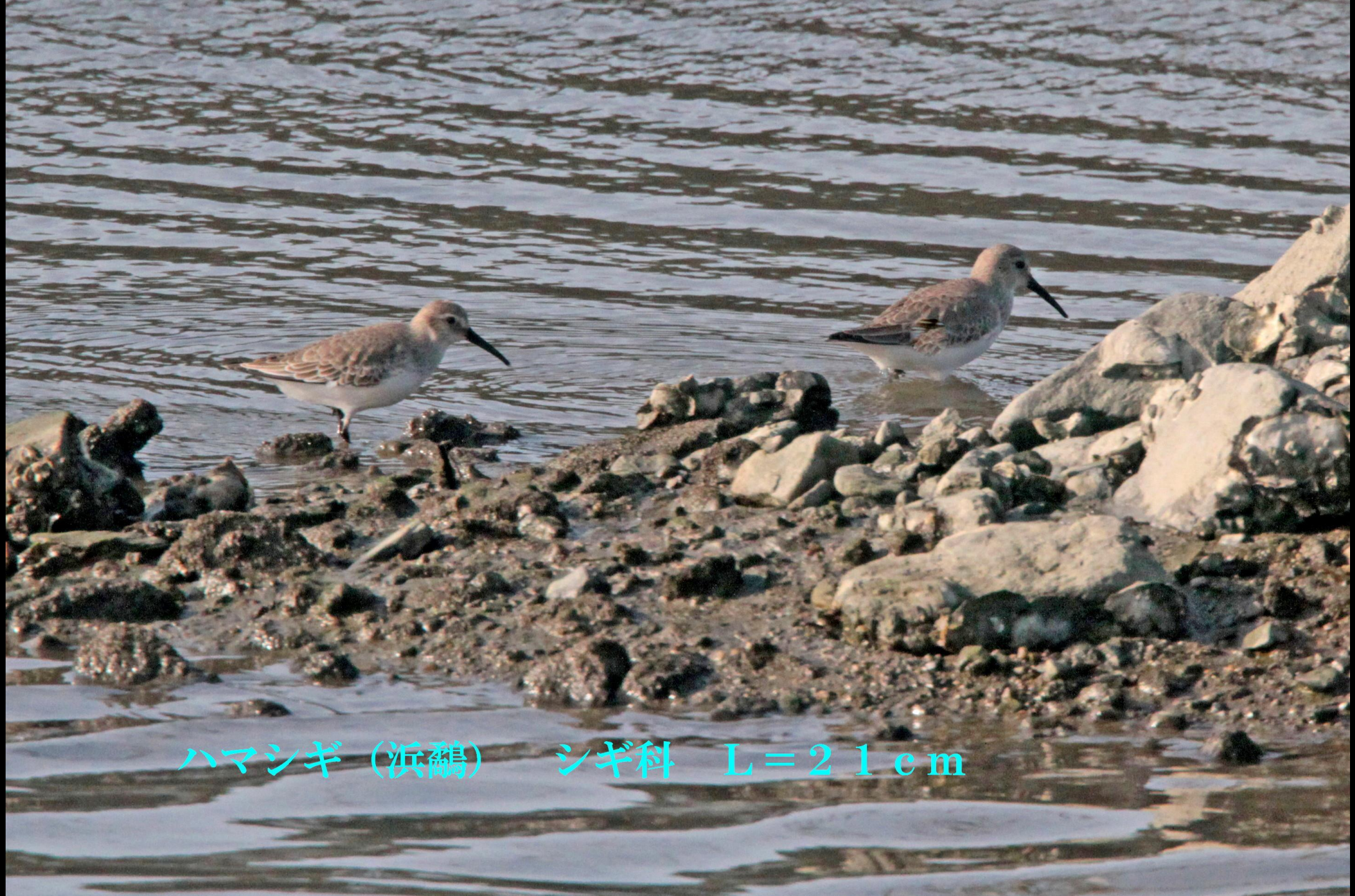
ハマシギ (滨鹬) シギ科 L=21cm