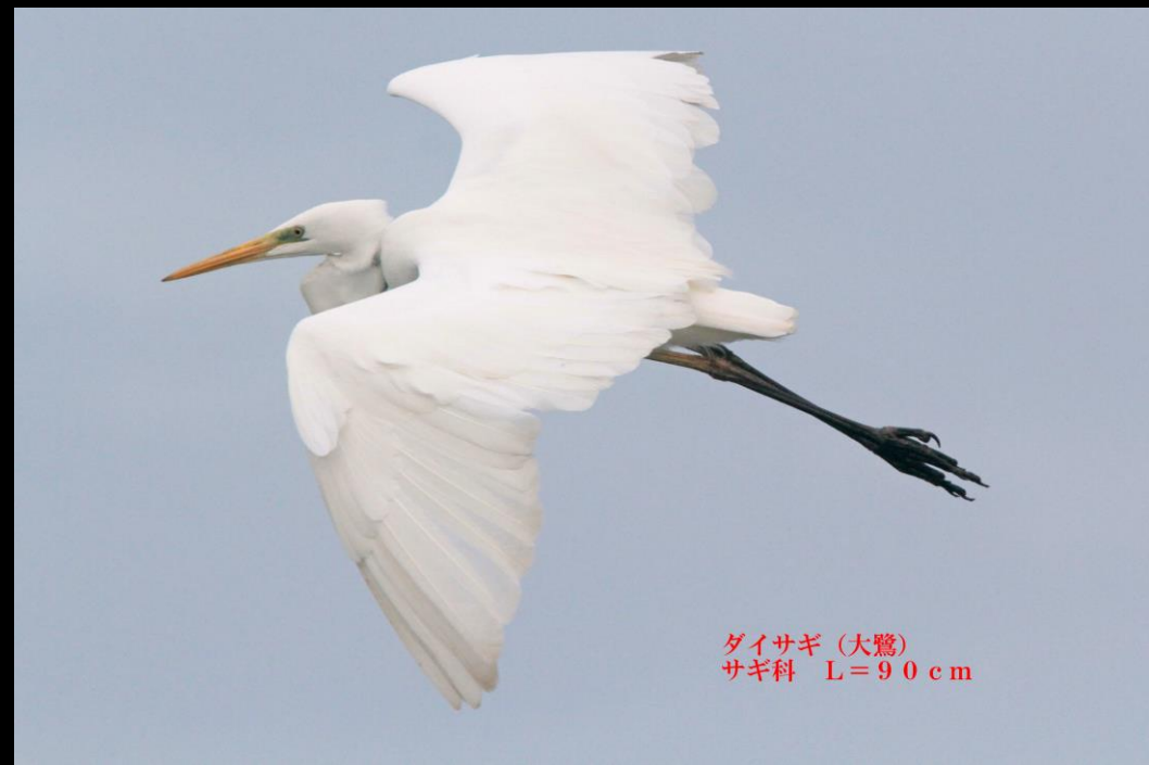
ダイサギ (大鷺) サギ科 L=90 cm