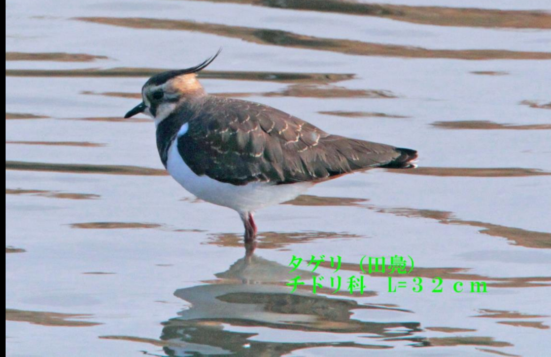
タゲリ (田島) チドリ科 L=32cm