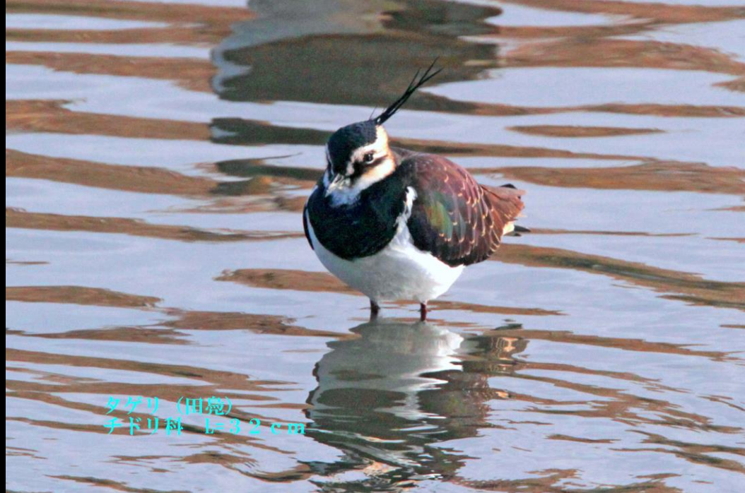
タゲリ (田島) チドリ科 L=32cm