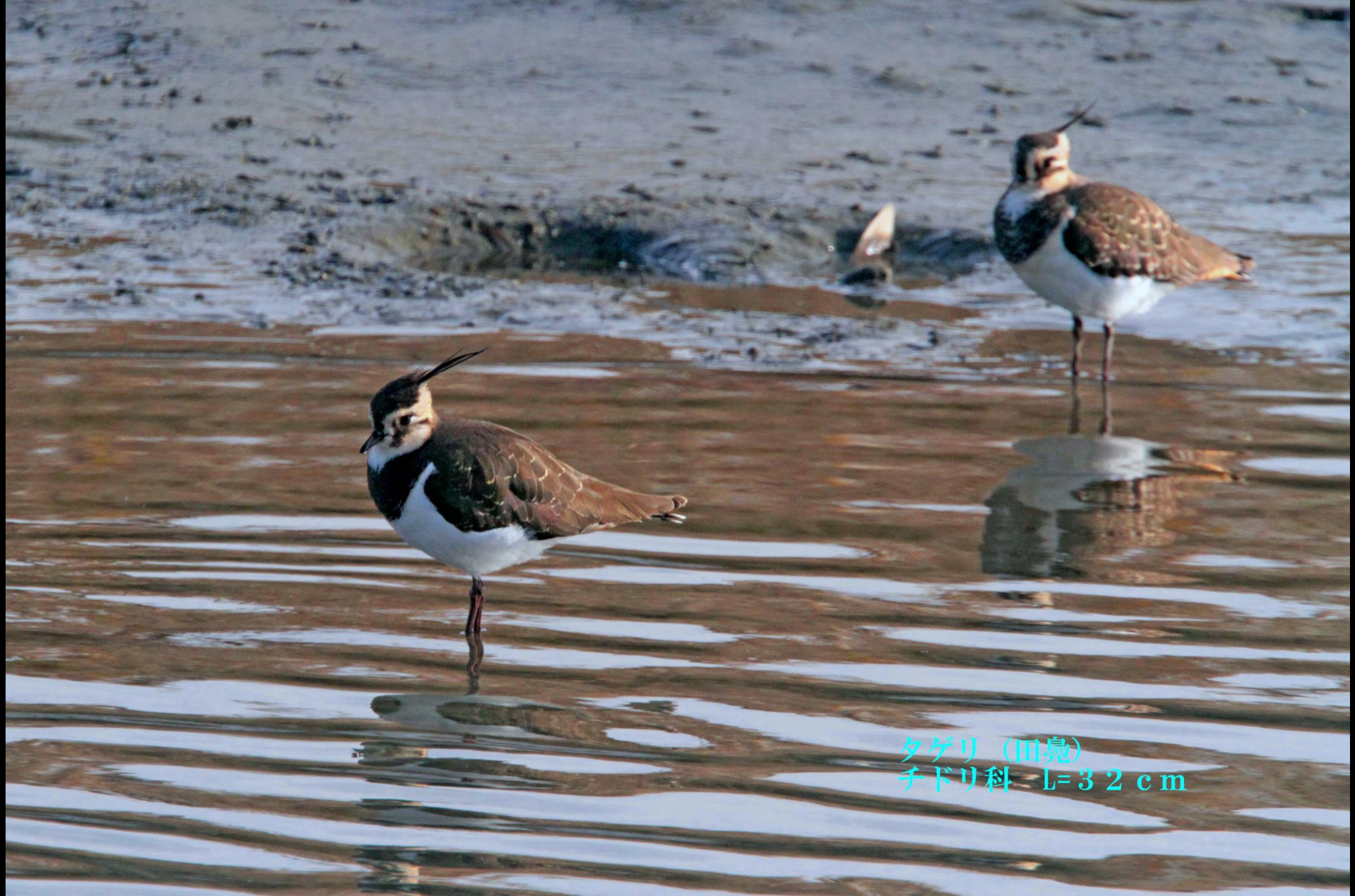
タゲリ (田鳧) チドリ科 L=32cm