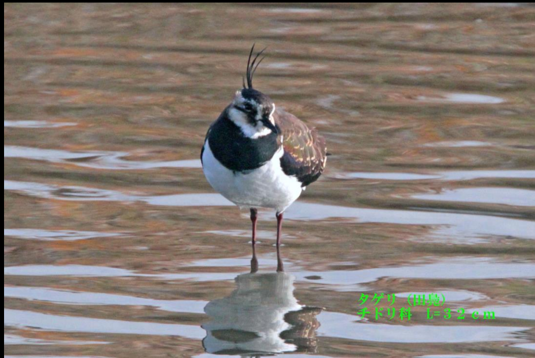
タゲリ (田島) チドリ科 L=32cm