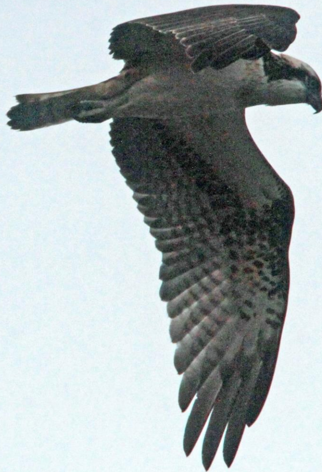
ミサゴ (鵟) ワシタカ科 L=メス64cm