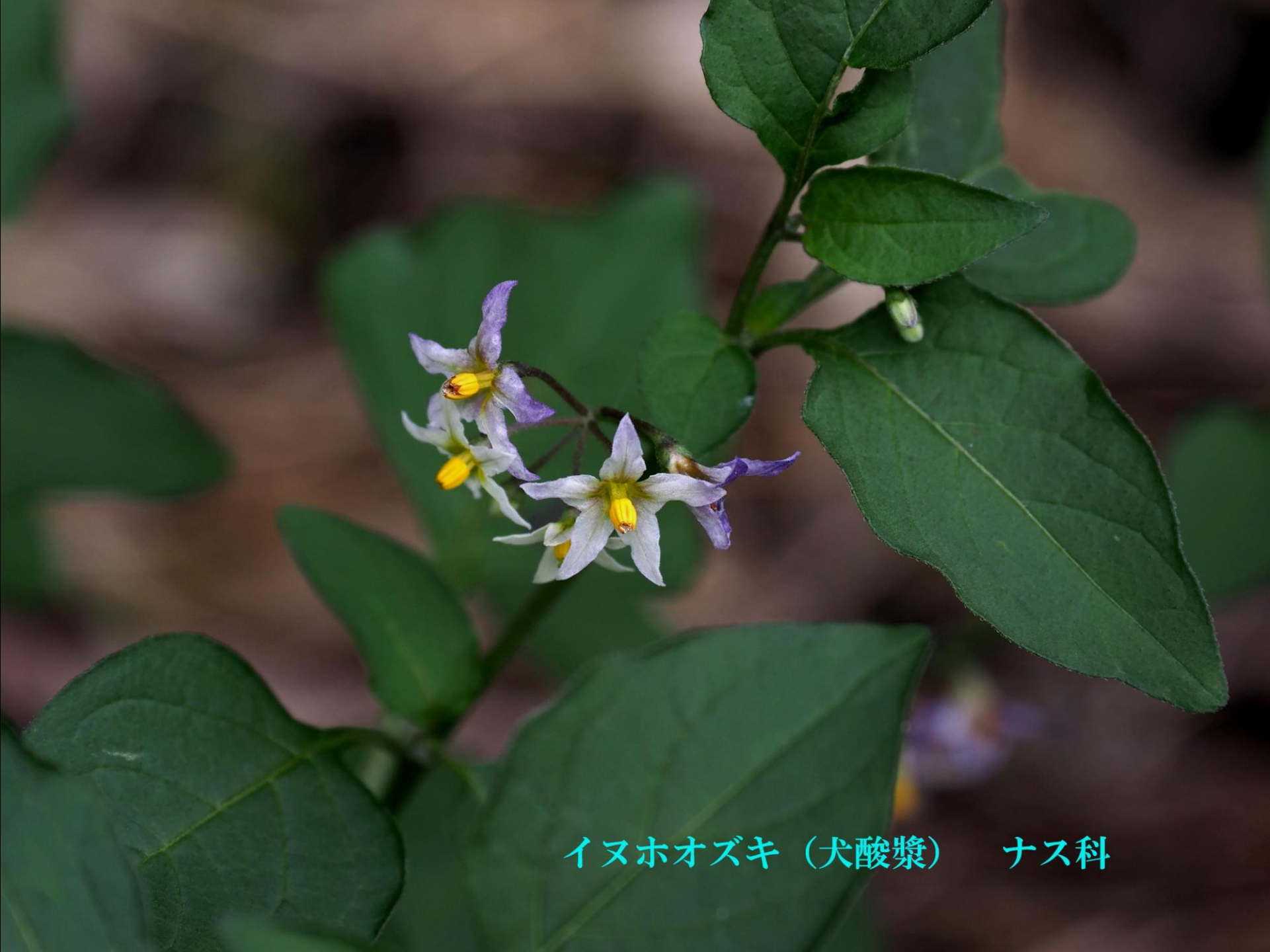
イヌホオズキ (犬酸漿) ナス科