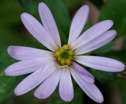
ヨメナ (嫁菜) キク科