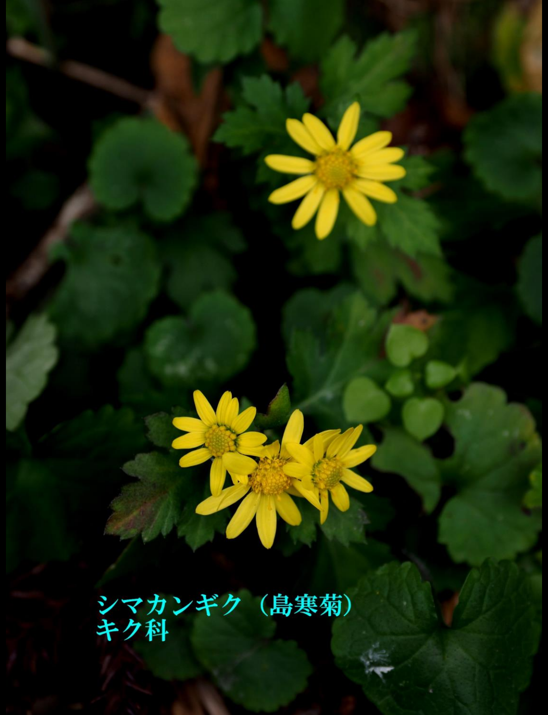
シマカンギク（島寒菊） キク科