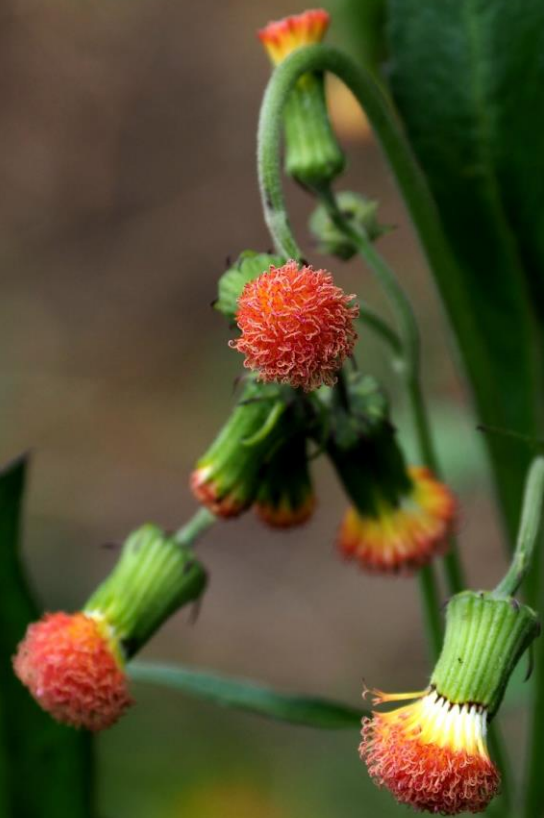
ベニバナボロギク（紅花檻樓菊） キク科 アフリカ原産の帰化植物