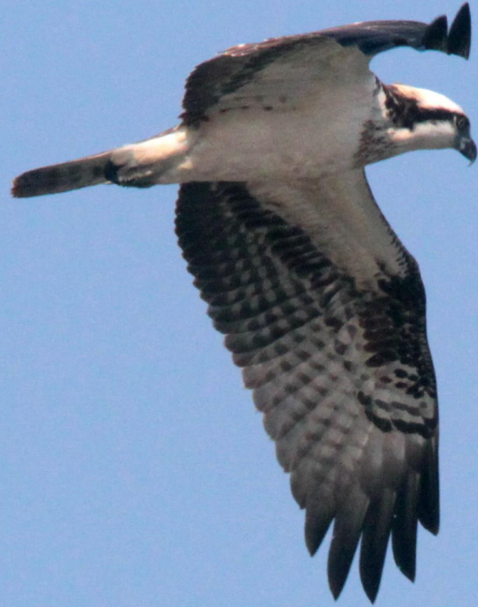
ミサゴ (鶚) ワシタカ科 L=メス64cm