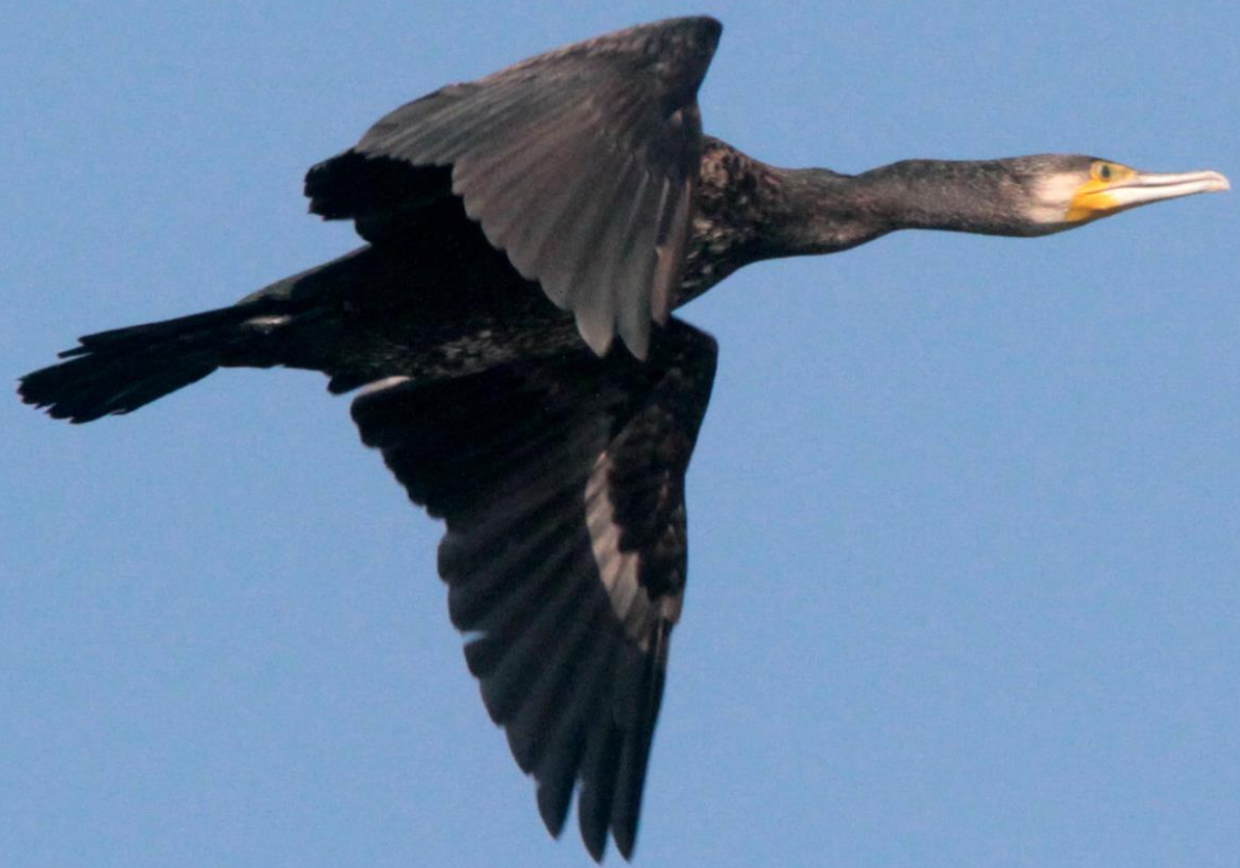
カワウ (河鵜) ウ科 L=82cm