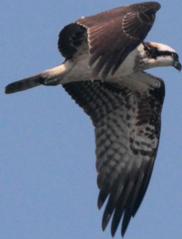
ミサゴ (鶺鴒) ワシタカ科 L=メス64cm