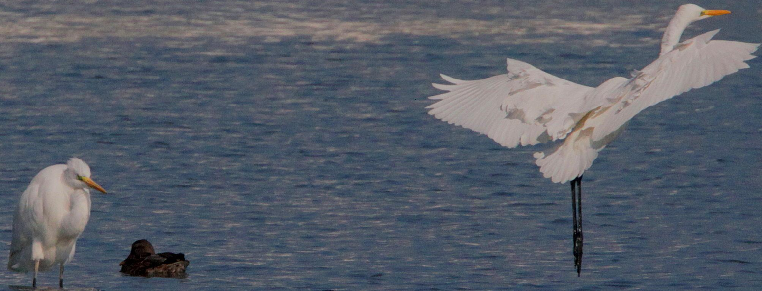
ダイサギ(大鷺) サギ科 L=90cm