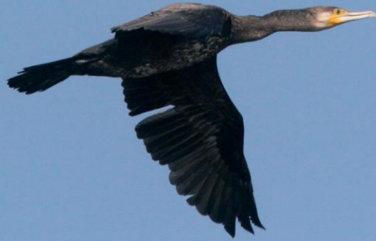
カワウ(河鵜) ウ科 L=82cm