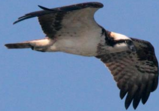
ミサゴ(鶯) ワシタカ科 L=メス64cm