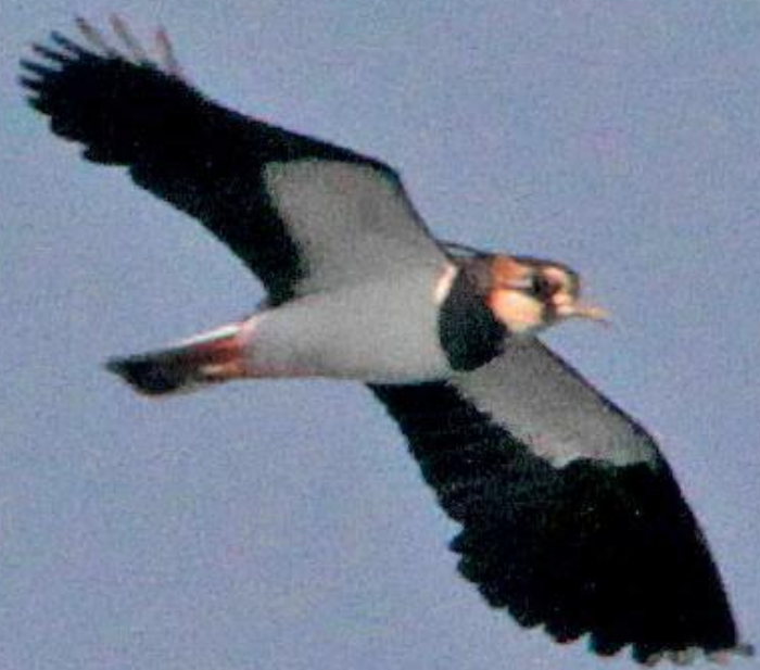
タゲリ (田鳧) チドリ科 L=32cm