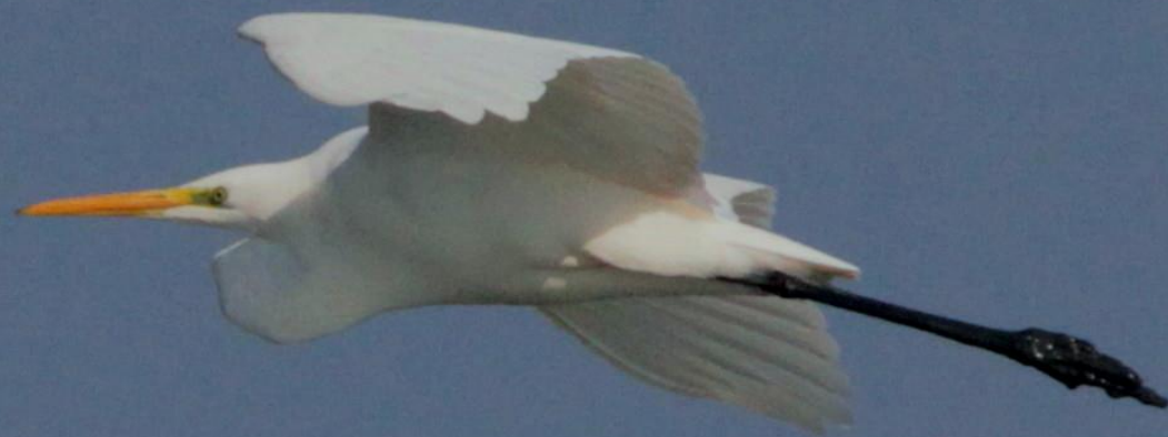
ダイサギ (大鷺) サギ科 L=90cm