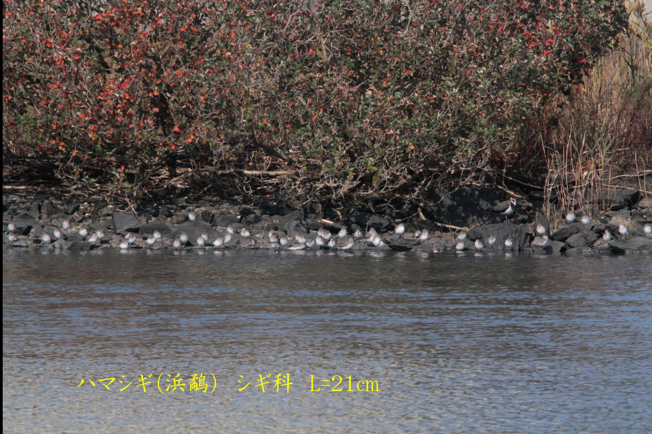
ハマシギ(浜鹬) シギ科 L=21cm