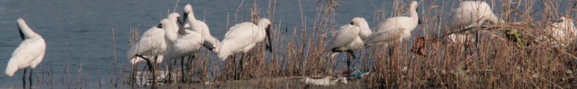
クロツラヘラサギ (黒面篋鷺) トキ科 L=77cm