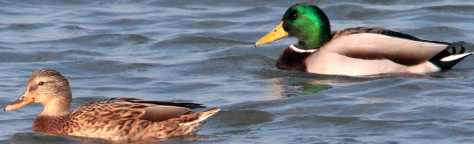
マガモ(真鴨) ガンカモ科 L=59cm