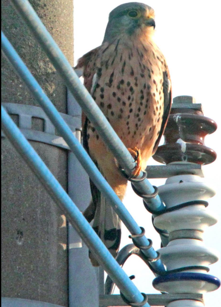
チョウゲンボウ(長元坊) ハヤブサ科 L=オス33cm