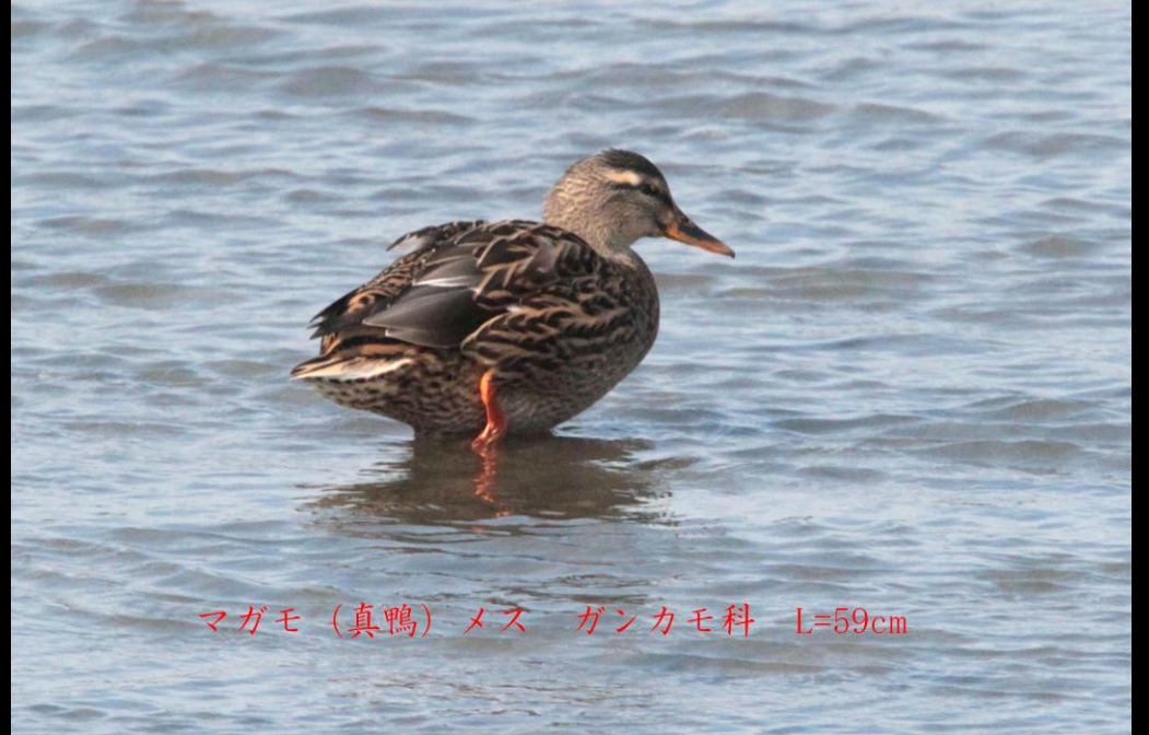
マガモ (真鴨) メス ガンカモ科 L=59cm