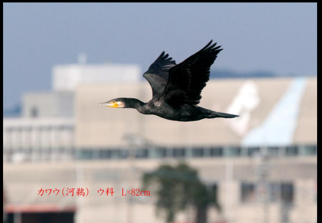
カワウ (河鵜) ウ科 L=82cm