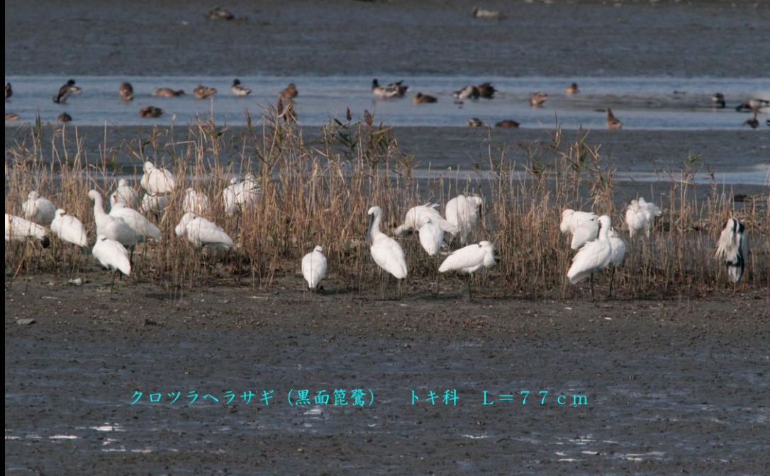
クロツラヘラサギ (黒面篋鷺) トキ科 L=77cm