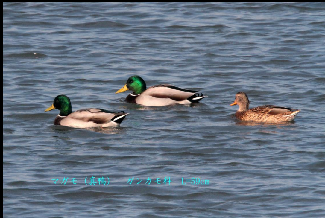
マガモ (真鴨) ガンカモ科 L=59cm