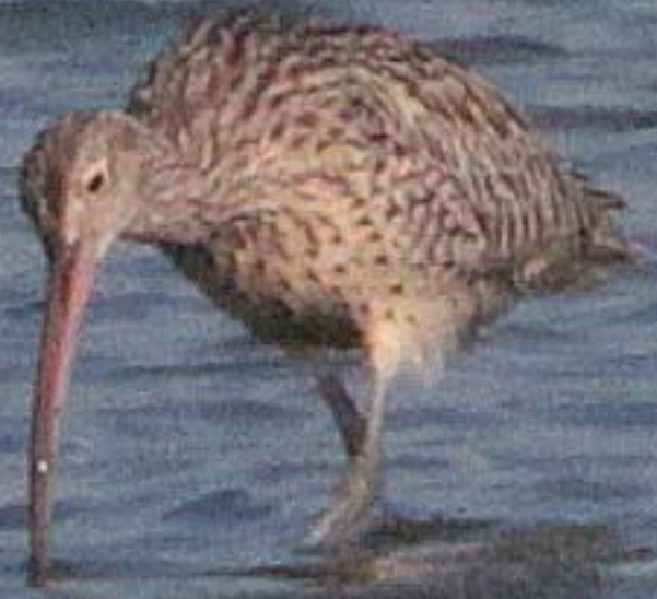
ホウロクシギ (焙烙鷗) シギ科 L=63 c m