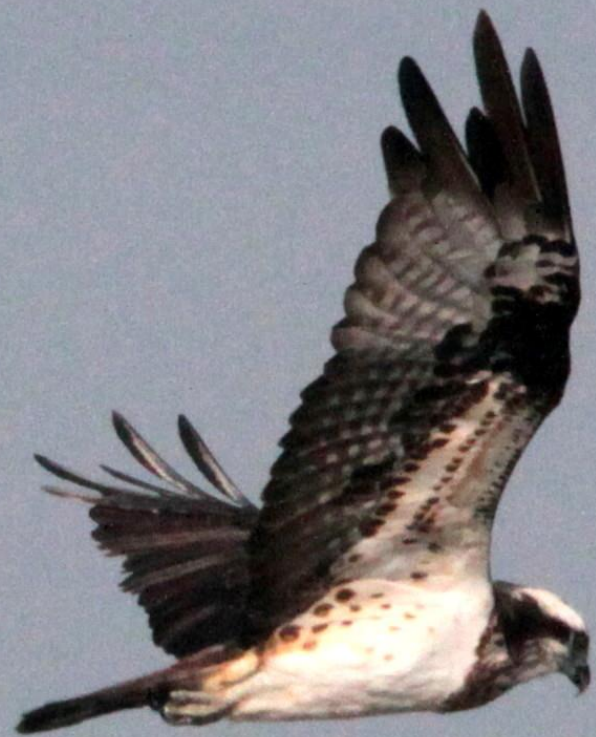
ミサゴ(鵟) ワシタカ科 L=メス64cm