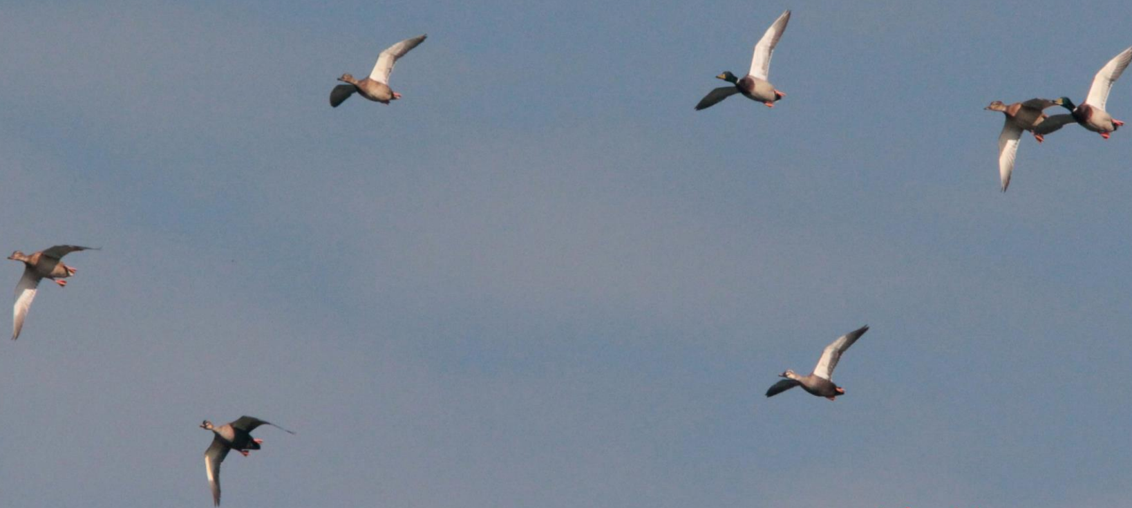
マガモ(真鴨) ガンカモ科 L=59cm