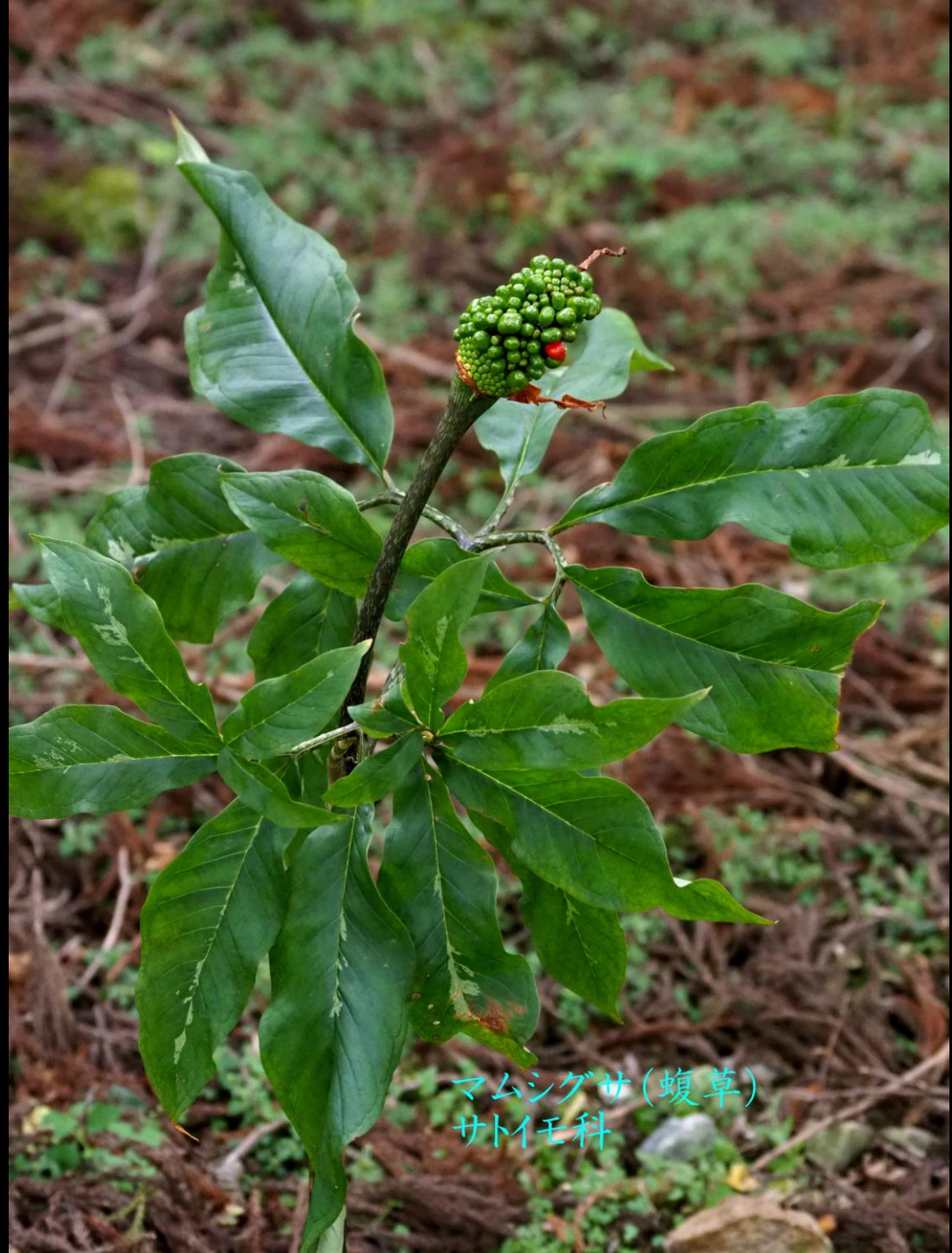
マムシグサ(蝮草) サトイモ科