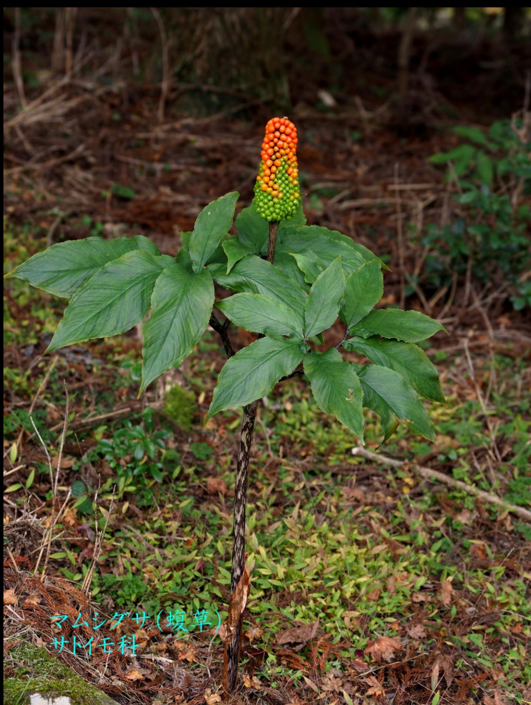
マムシグサ(蝮草) サトイモ科