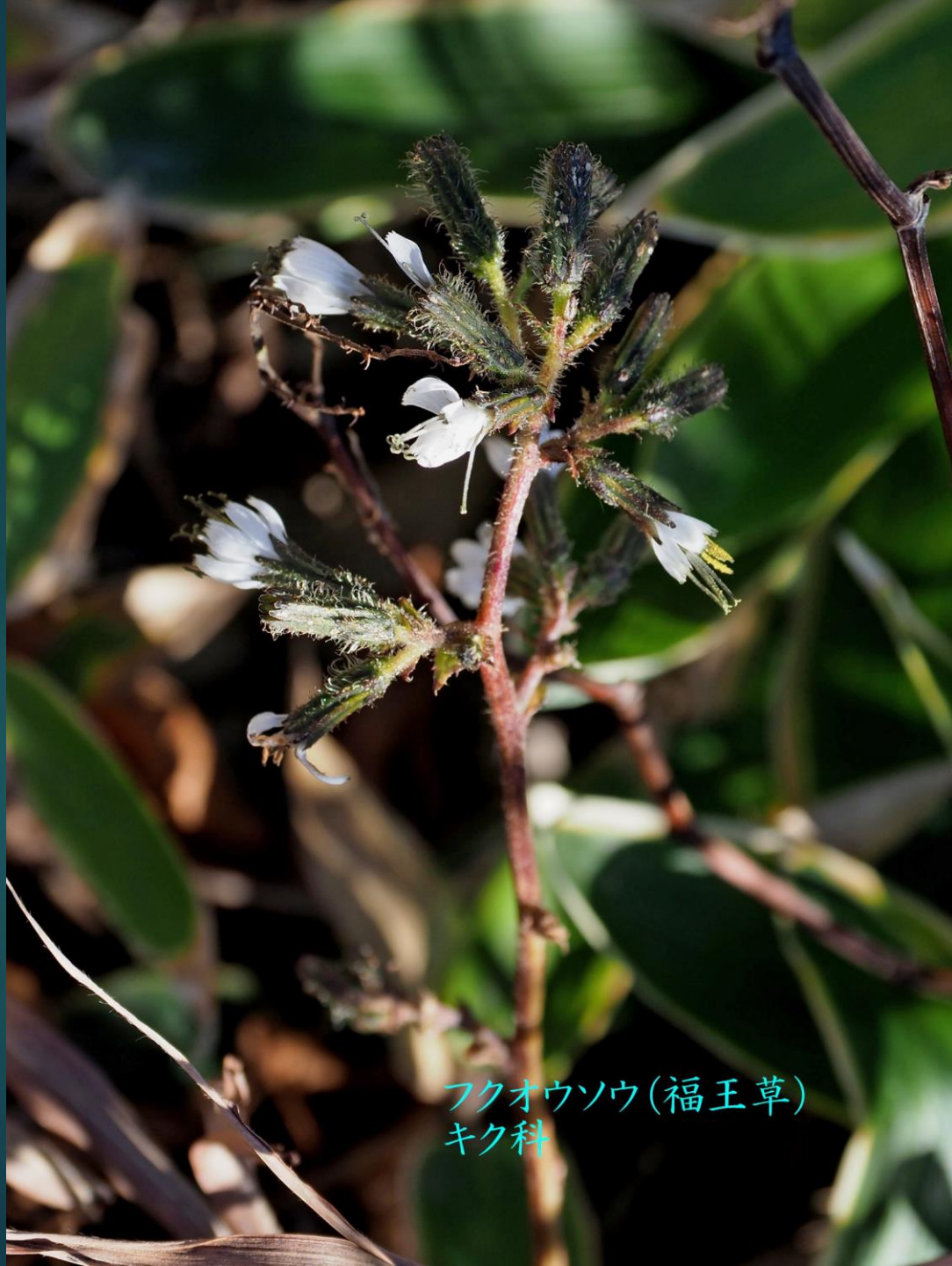
フクオウソウ(福王草) キク科