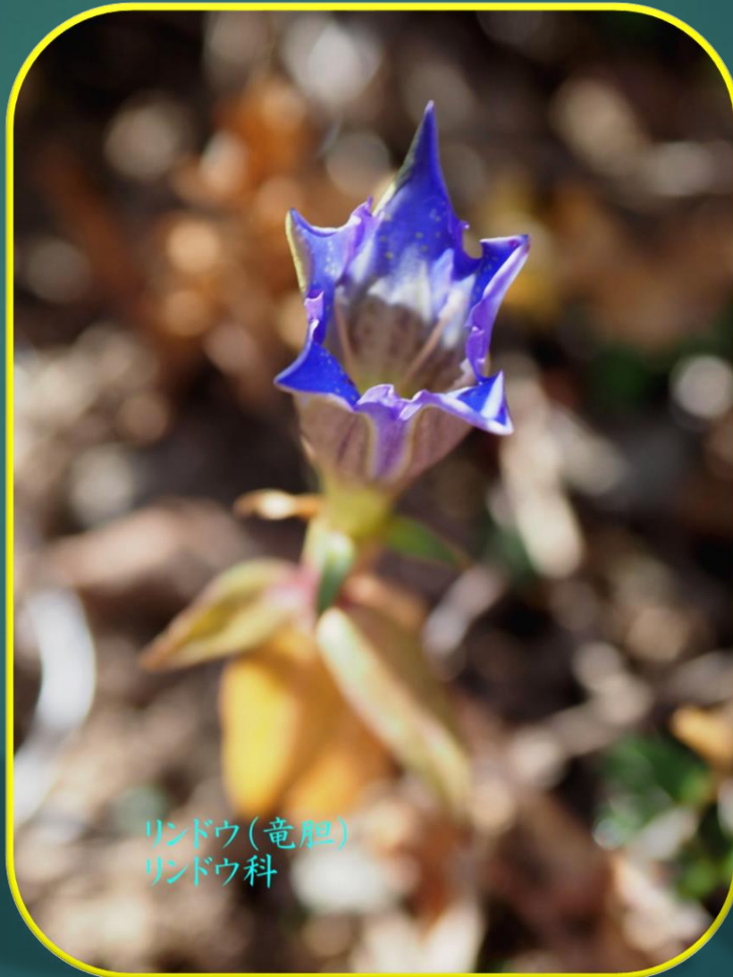
リンドウ(竜胆) リンドウ科