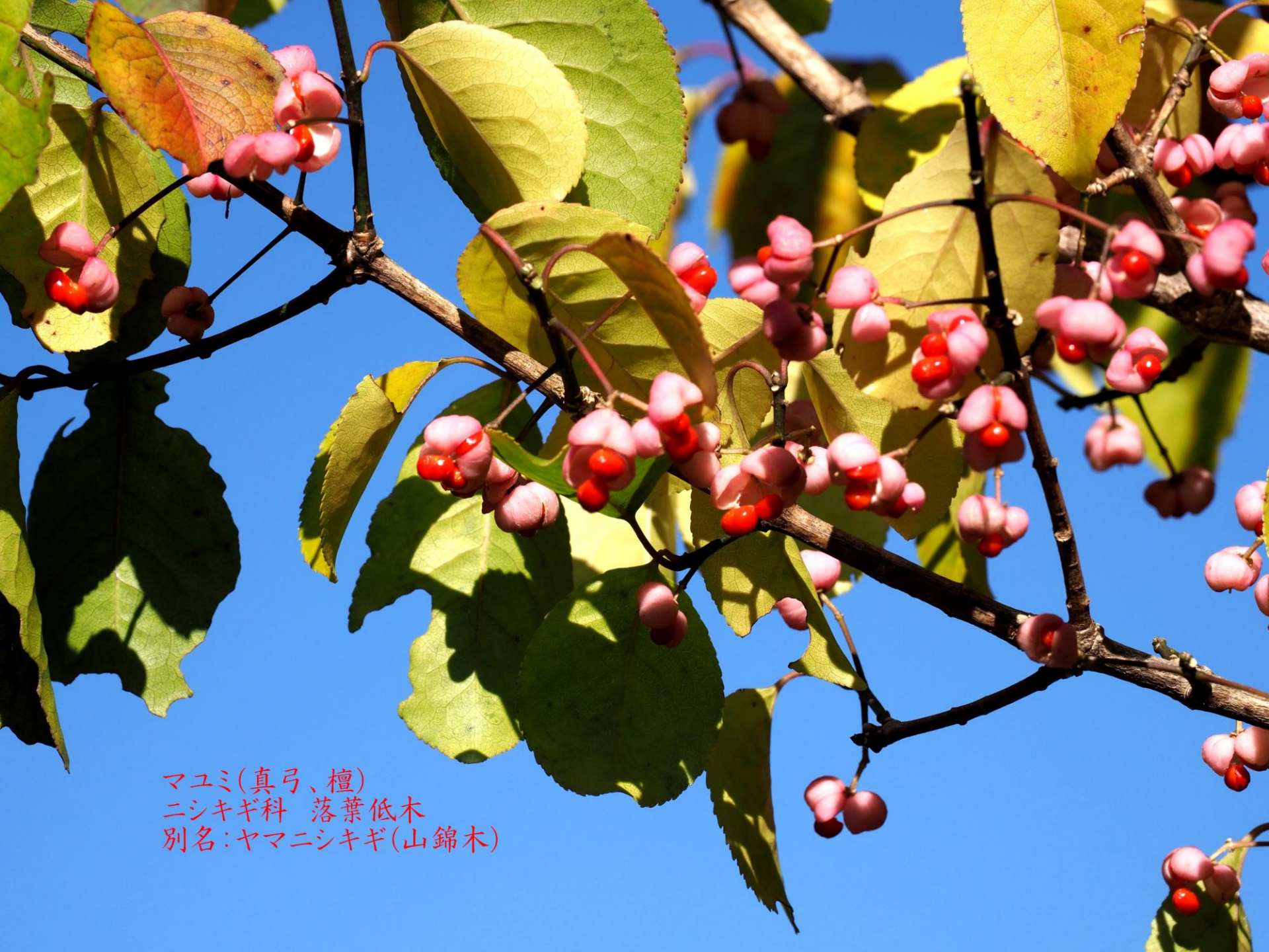
マユミ(真弓、檀) ニシキギ科 落葉低木 別名:ヤマニシキギ(山錦木)