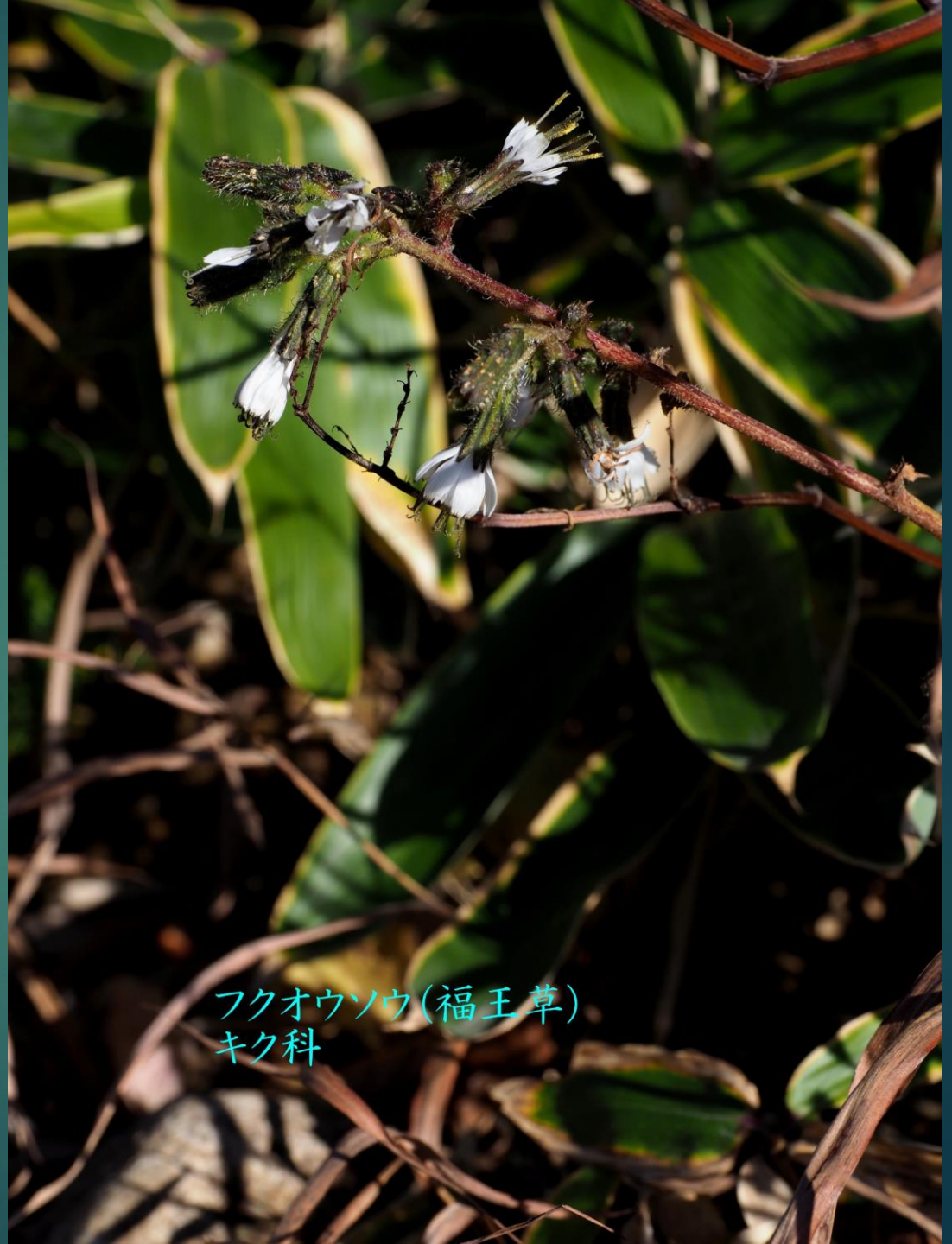
フクオウソウ(福王草) キク科