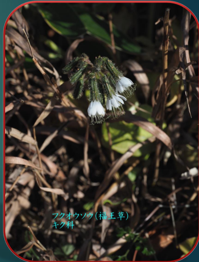
フクオウソウ(福王草) キク科