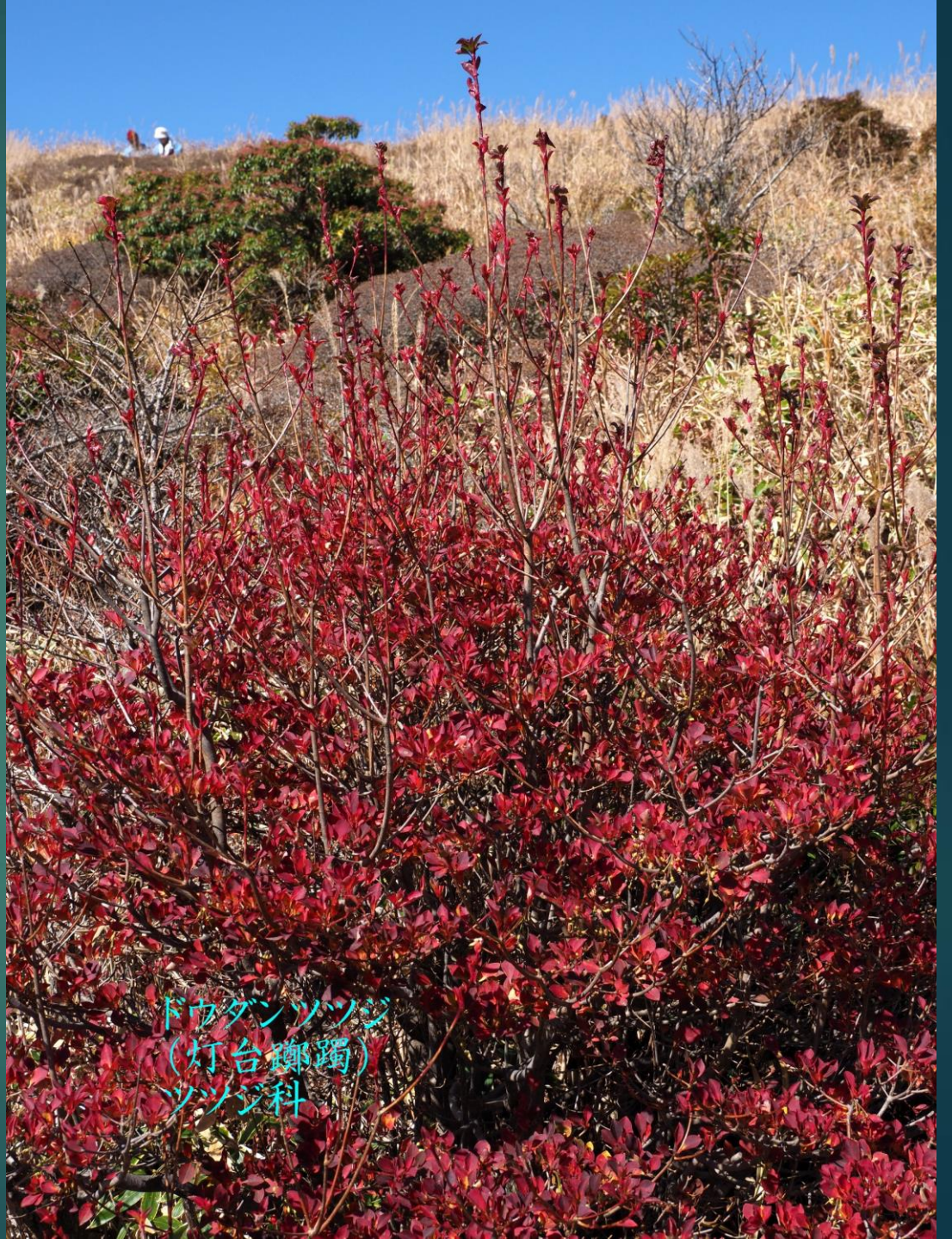
ドウダンツツジ (灯台御躑) ツツジ科