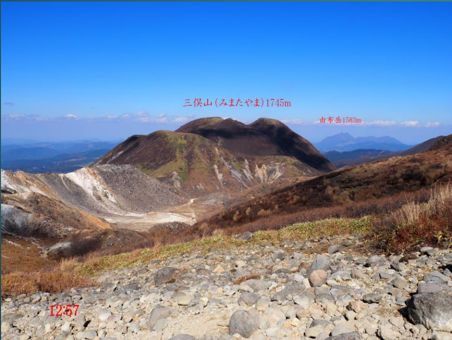
三俣山(みまたやま)1745m