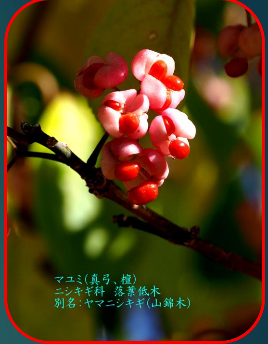
マユミ(真弓、檀) ニシキギ科 落葉低木 別名:ヤマニシキギ(山錦木)