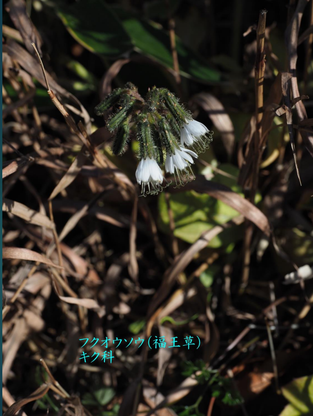
フクオウソウ(福王草) キク科