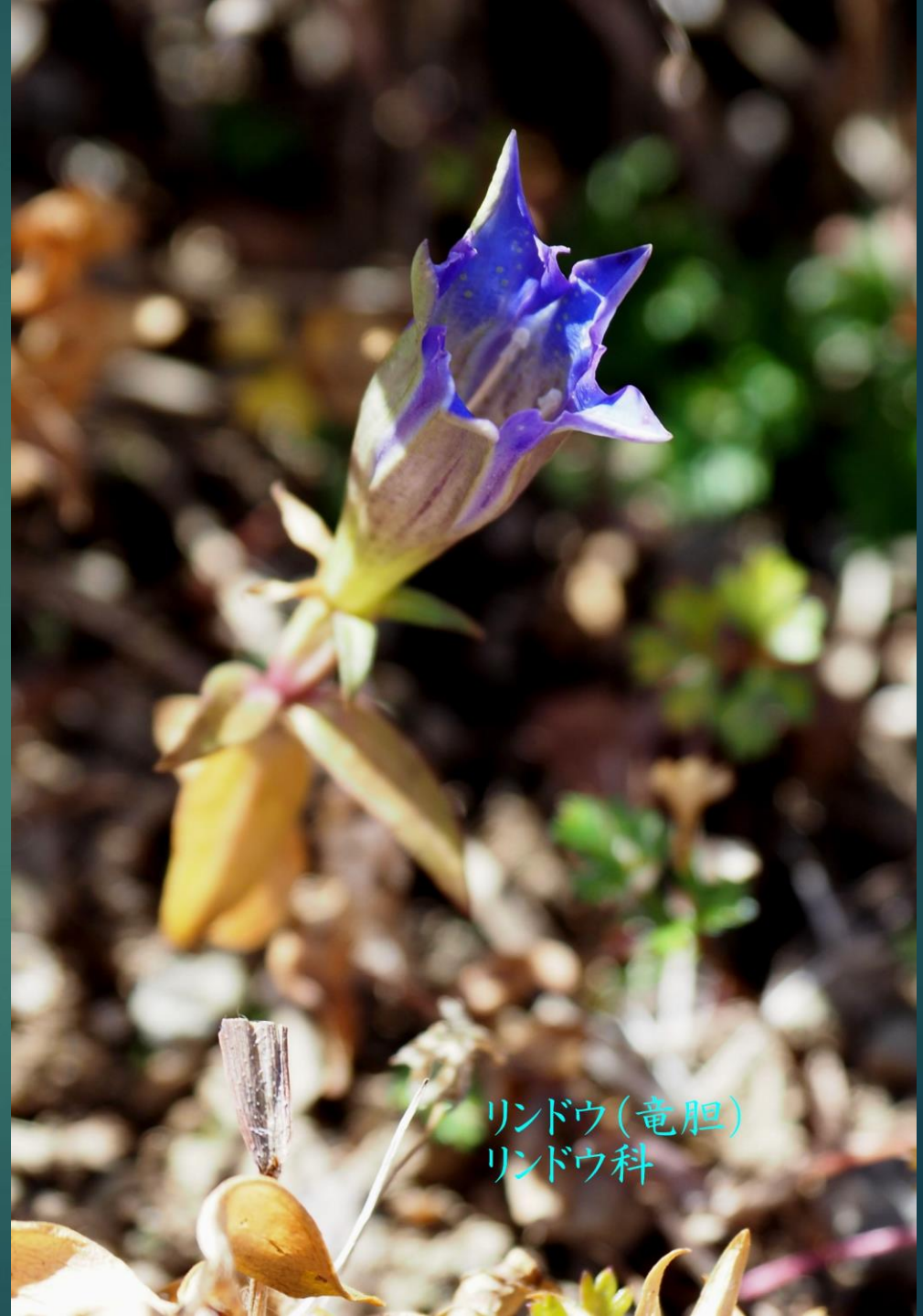
リンドウ(竜胆) リンドウ科