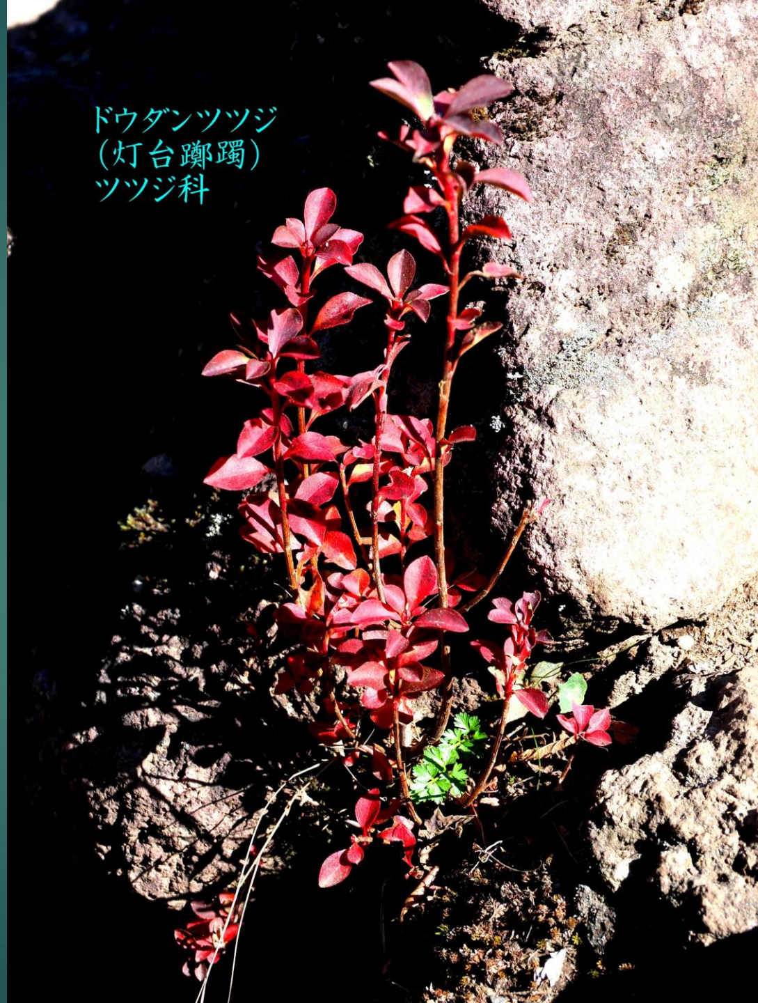
ドウダンツツジ (灯台躑躅) ツツジ科