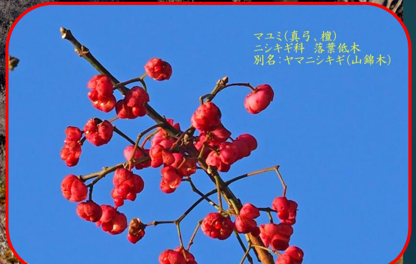
マユミ(真弓、檀) ニシキギ科 落葉低木 別名: ヤマニシキギ(山錦木)