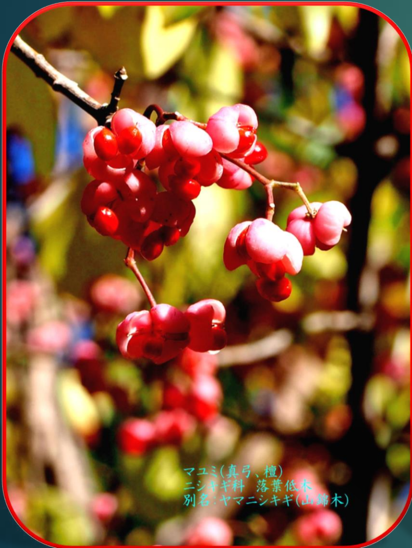
マユミ(真弓、檀) ニシキギ科 落葉低木 別名:ヤマニシキギ(山錦木)