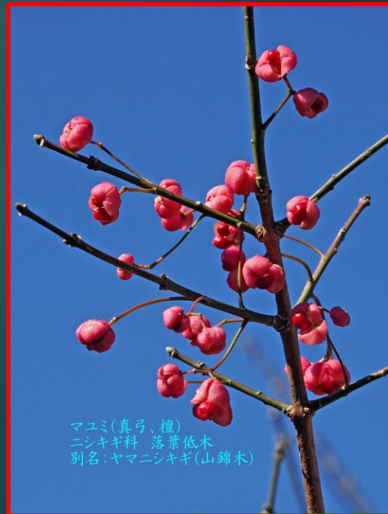
マユミ(真弓、檀) ニシキギ科 落葉低木 別名:ヤマニシキギ(山錦木)