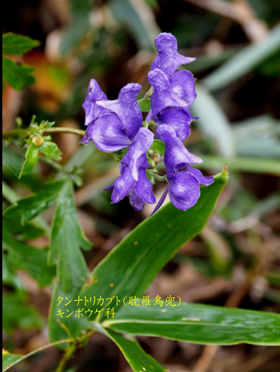
タンナトリカブト(耽羅烏兜) キンポウゲ科