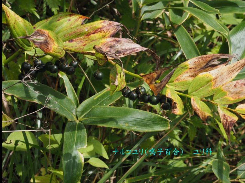
ナルコユリ(鳴子百合) ユリ科