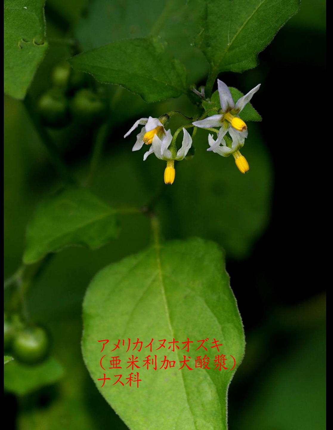
アメリカヌホオズキ (亜米利加犬酸漿) ナス科