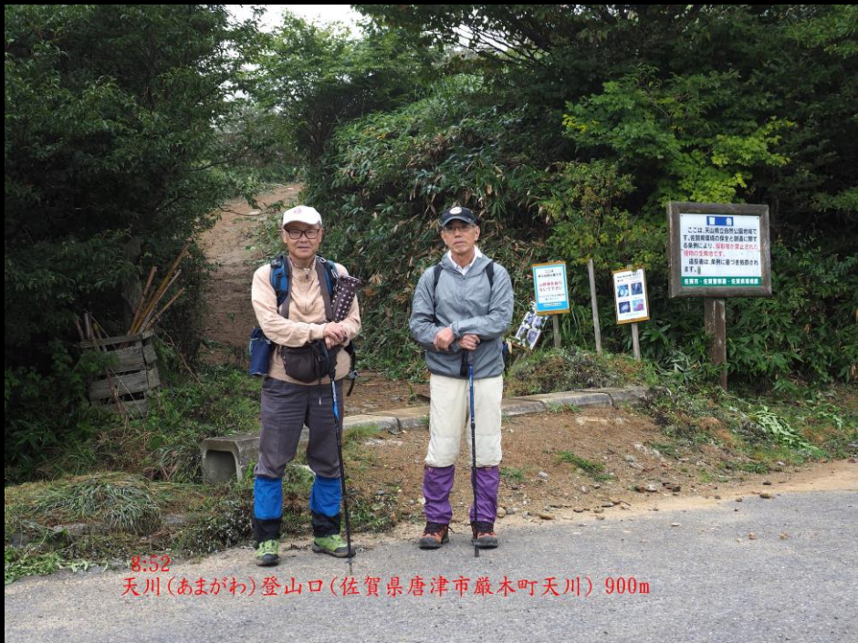
8:52 天川(あまがわ)登山口(佐賀県唐津市巖木町天川) 900m