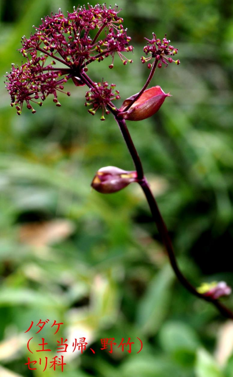
ノダケ (土当帰、野竹) セリ科