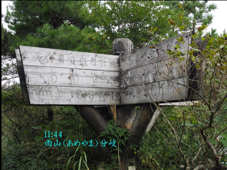
11:44 雨山(あめやま)分岐