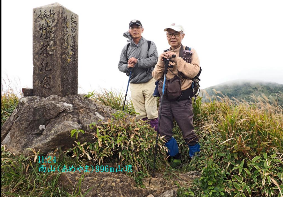
11:24 雨山(あめやま)996m山頂