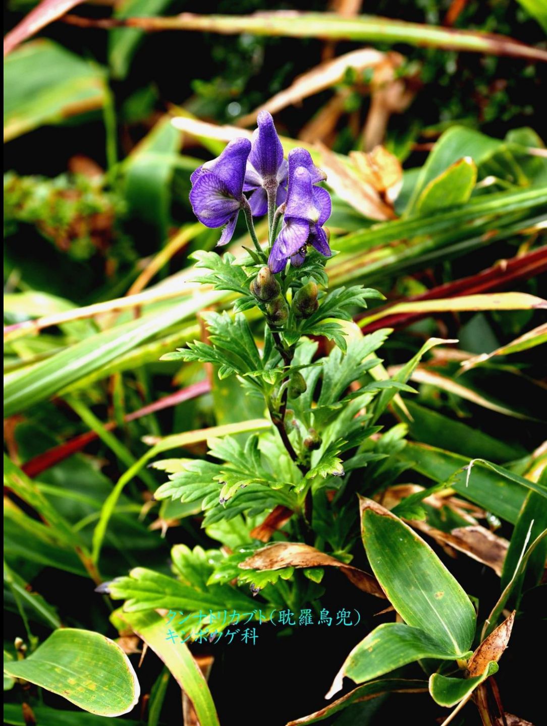
タンナトリカブト(耽羅烏兜) キンポウゲ科