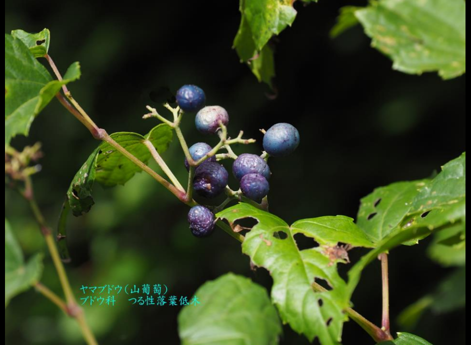
ヤマブドウ(山葡萄) ブドウ科 つる性落葉低木