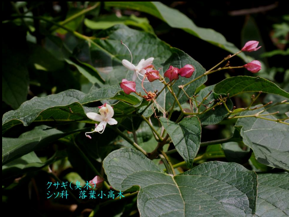
クサギ(臭木) シソ科 落葉小高木