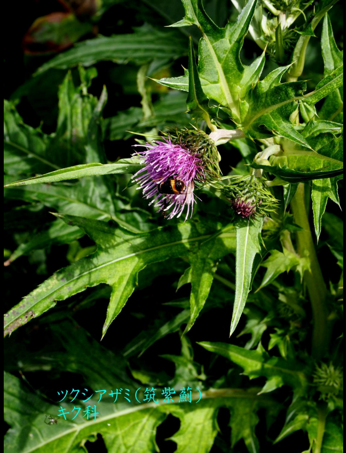
ツクシアザミ(筑紫薊) キク科