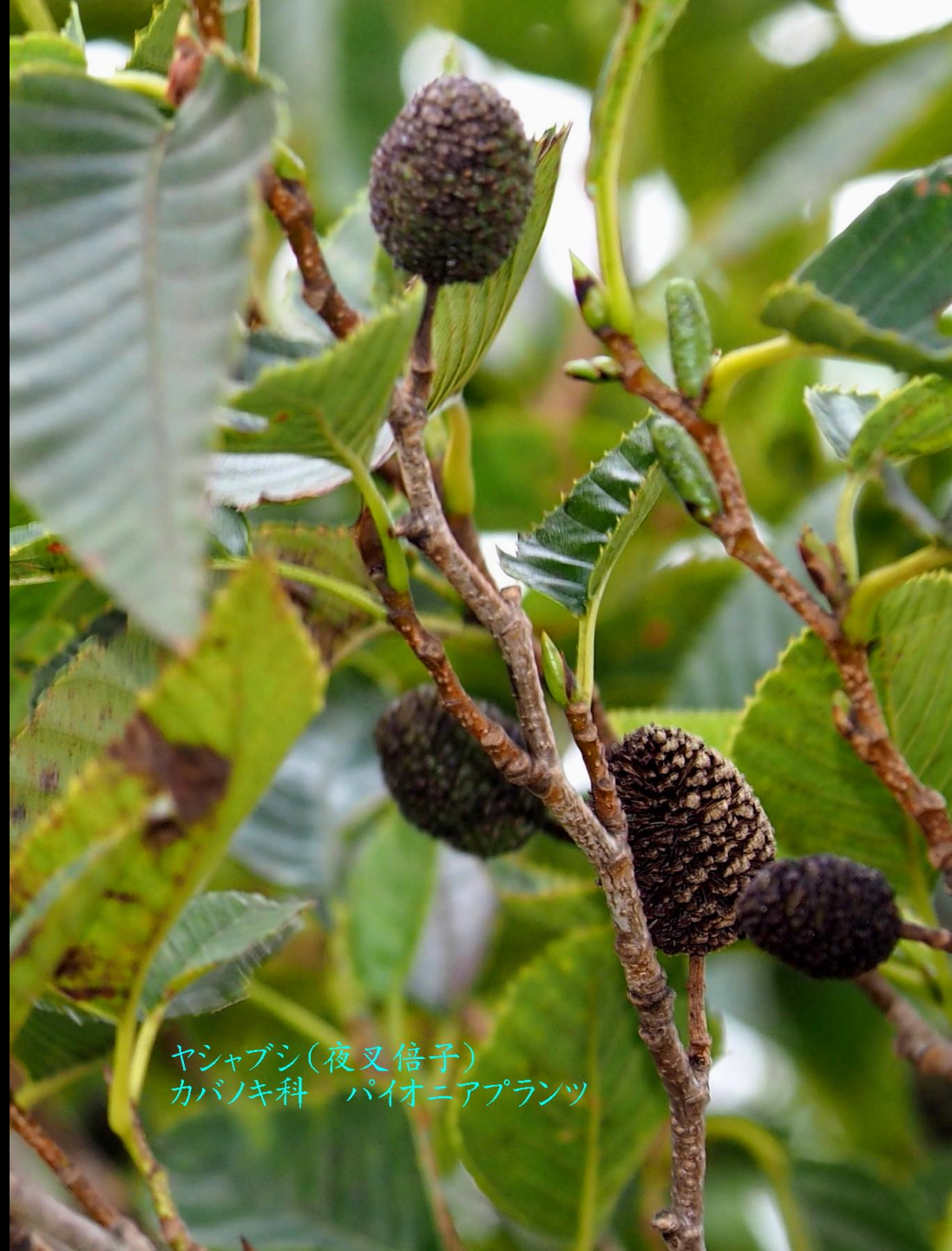
ヤシャブシ(夜叉倍子) カバノキ科 パイオニアプラント