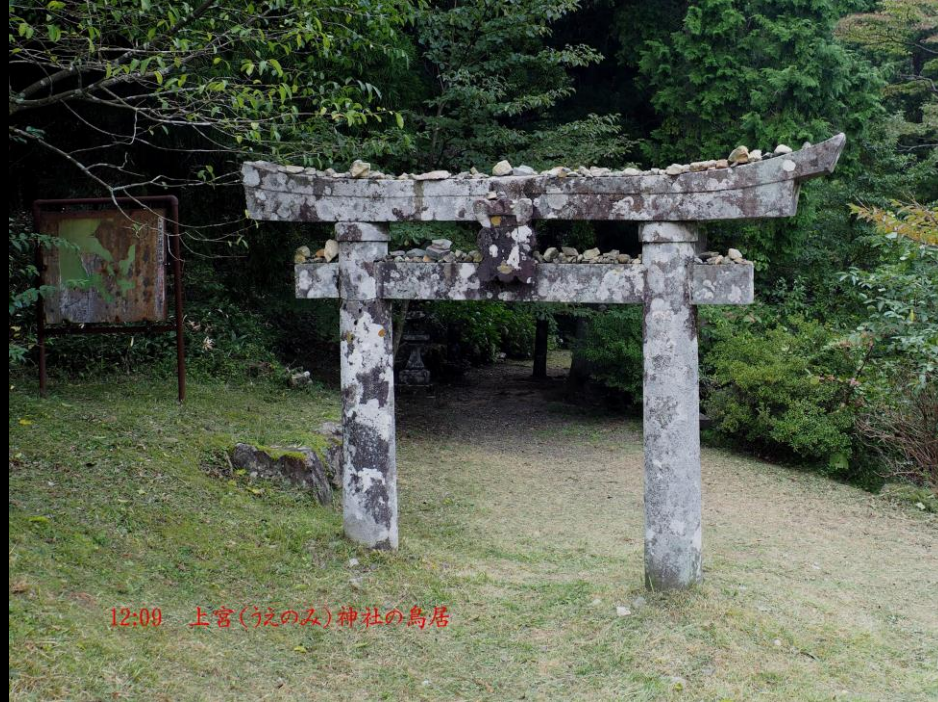
12:09 上宮(うへのみ)神社の鳥居