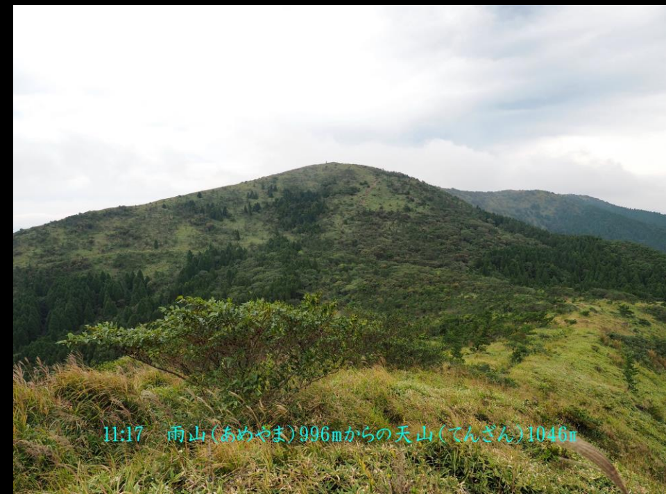
11:17 雨山(あめやま)996mからの天山(てんざん)1046m