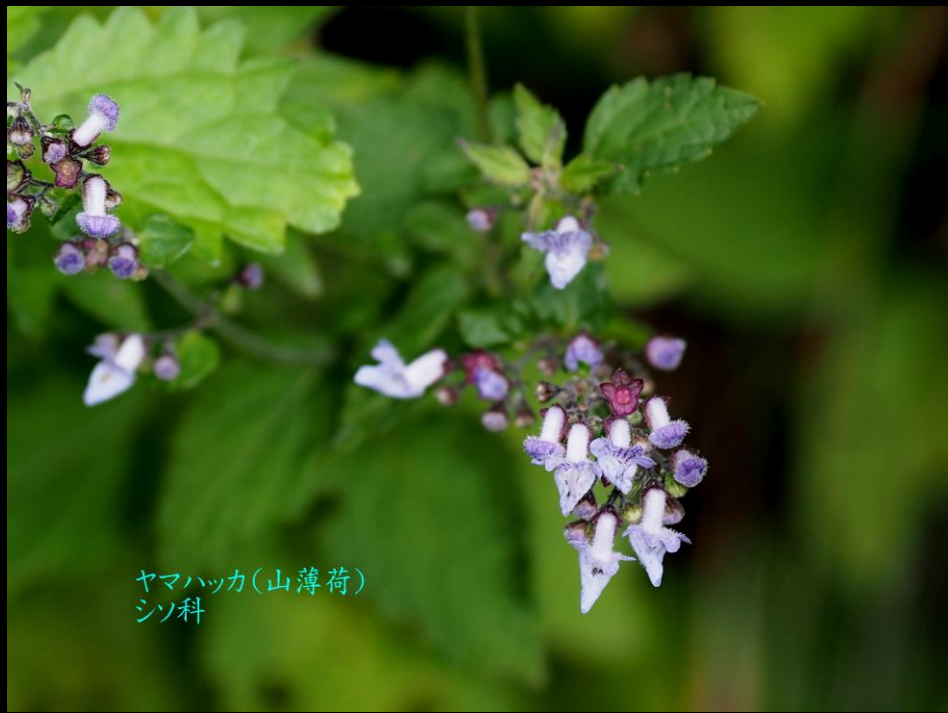
ヤマハッカ(山薄荷) シソ科