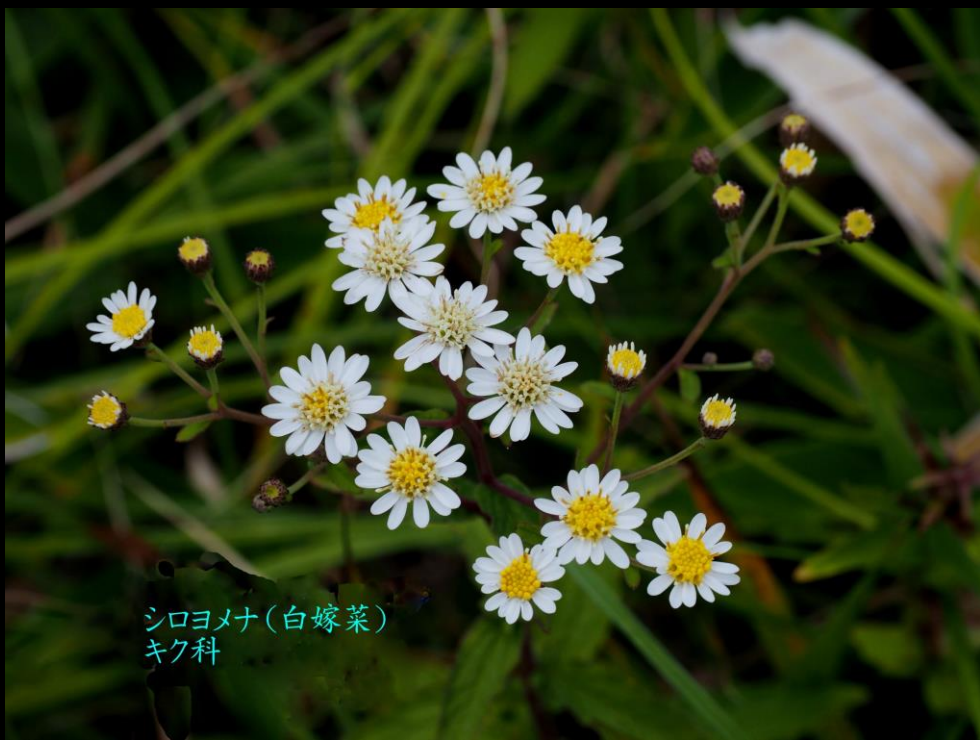
シロヨメナ(白嫁菜) キク科