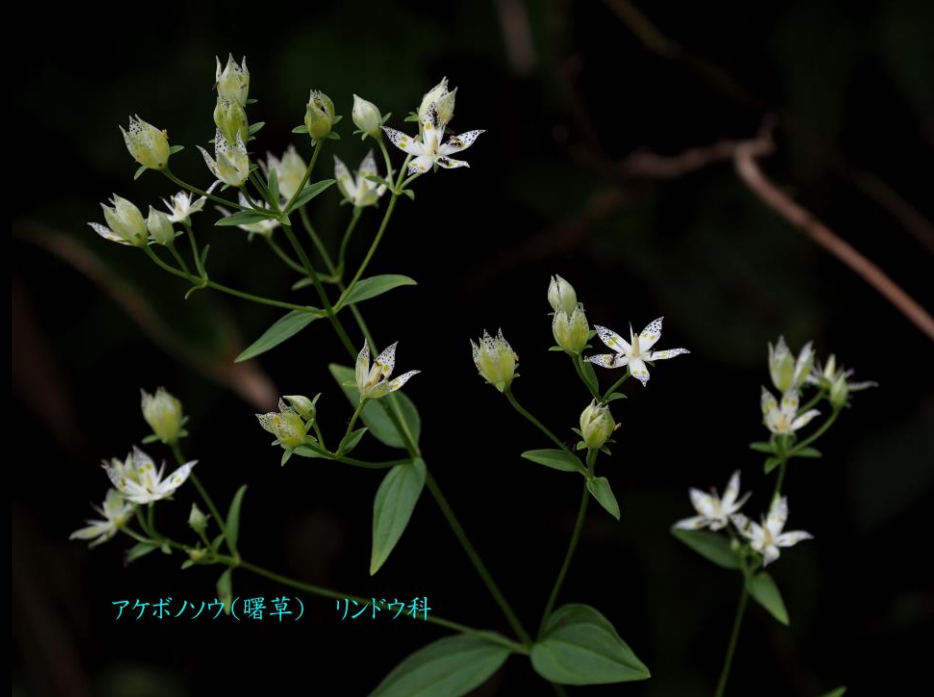
アケボノソウ(曙草) リンドウ科