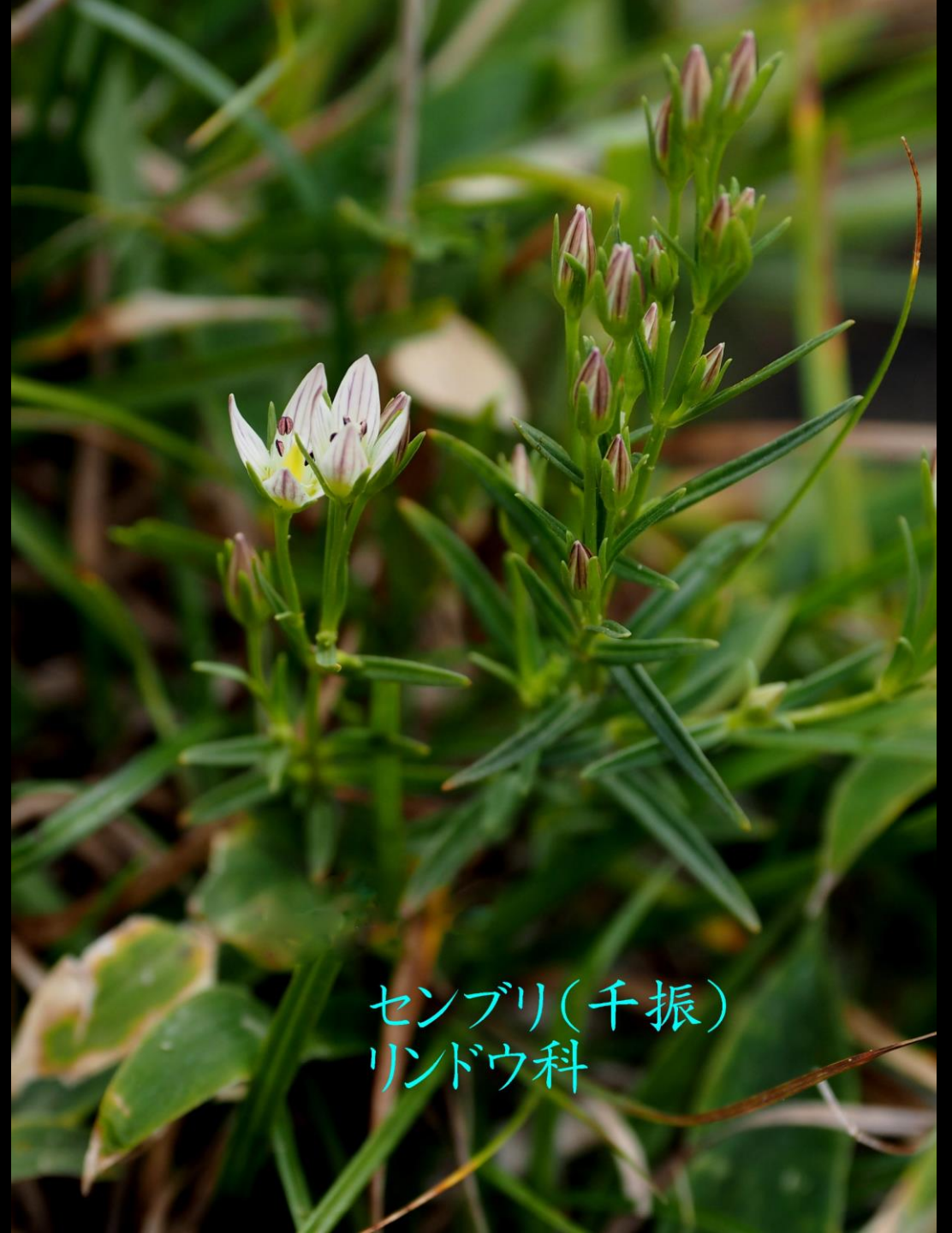
センブリ(千振) リンドウ科