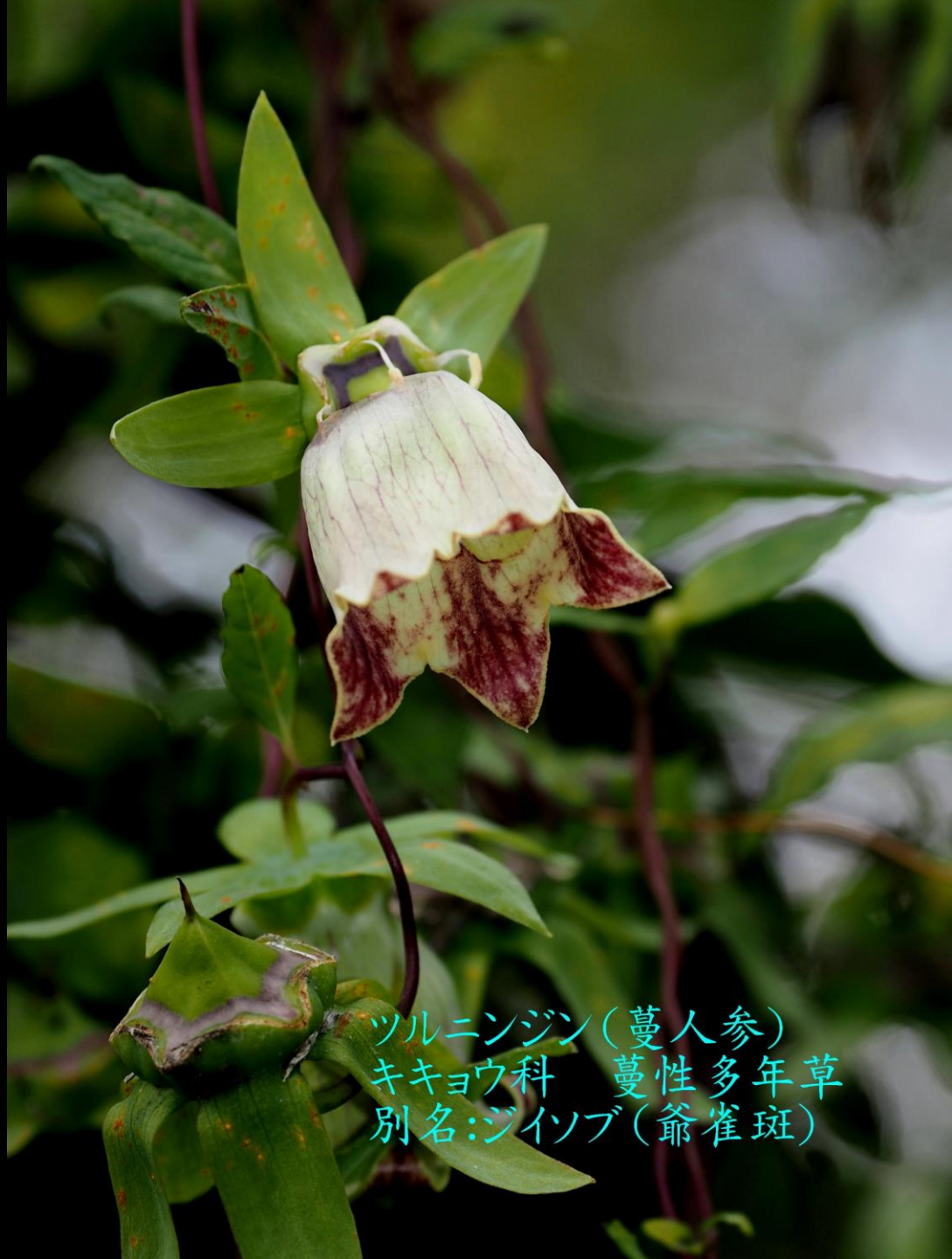
ツルニンジン(蔓人参) キキョウ科 蔓性多年草 別名:ジイソブ(爺雀斑)