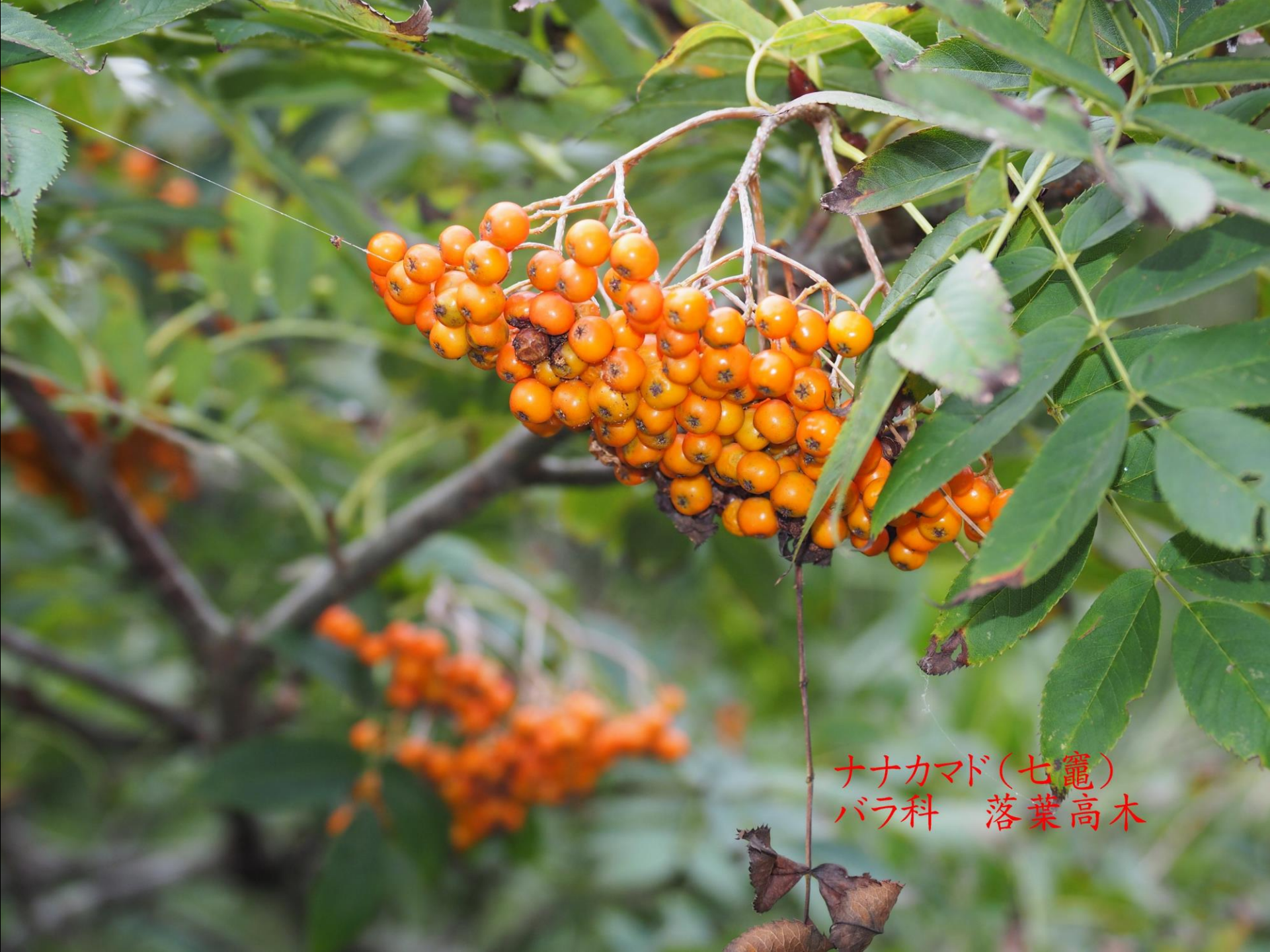
ナナカマド(七竈) バラ科 落葉高木