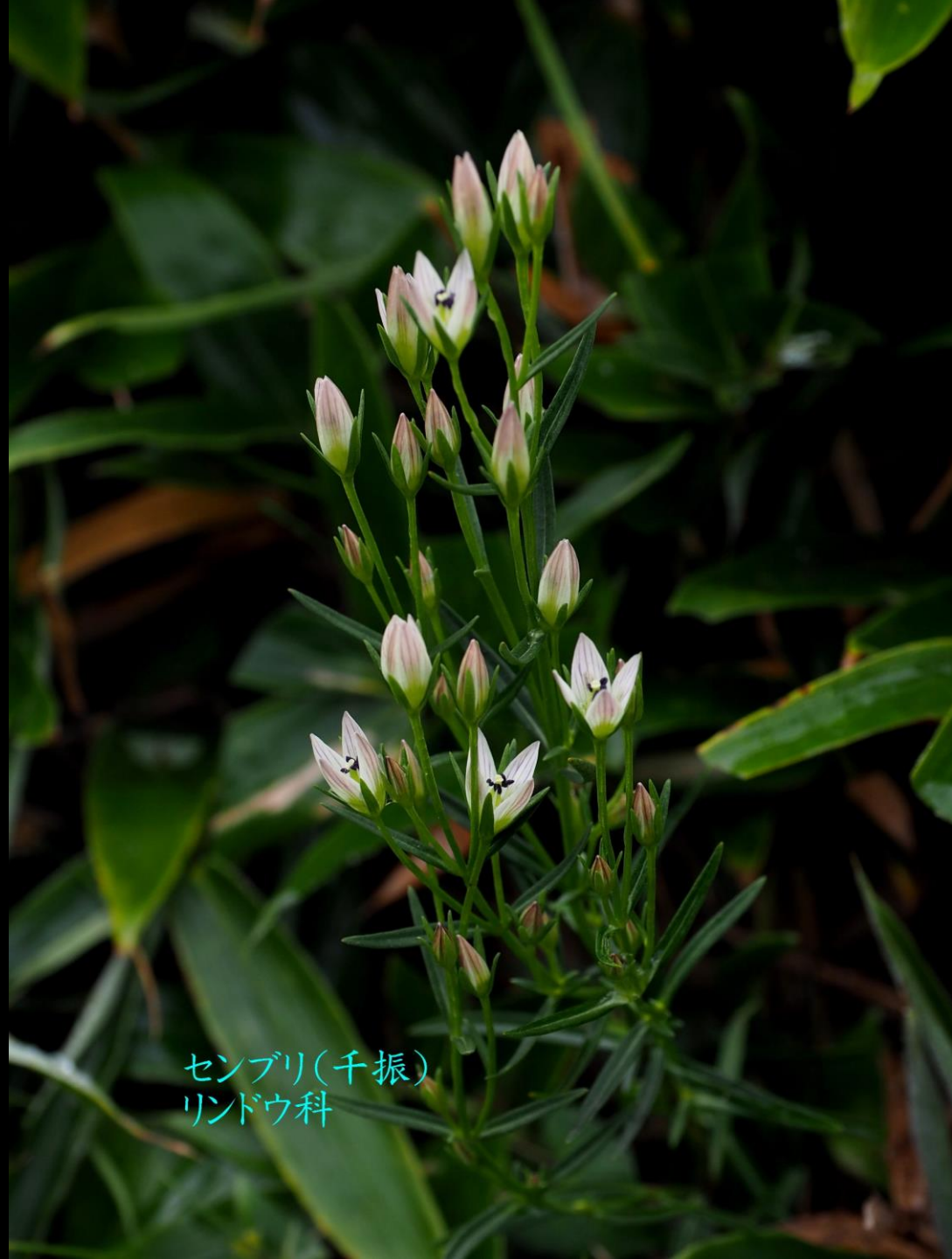
センブリ(千振) リンドウ科