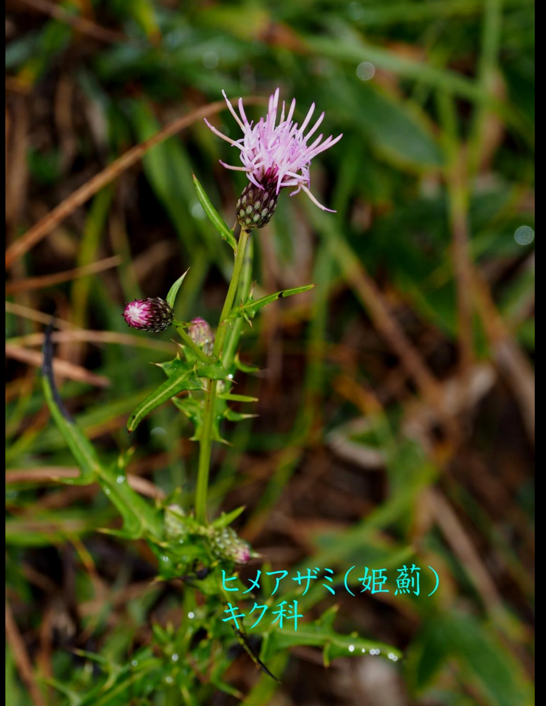
ヒメアザミ(姫薊) キク科