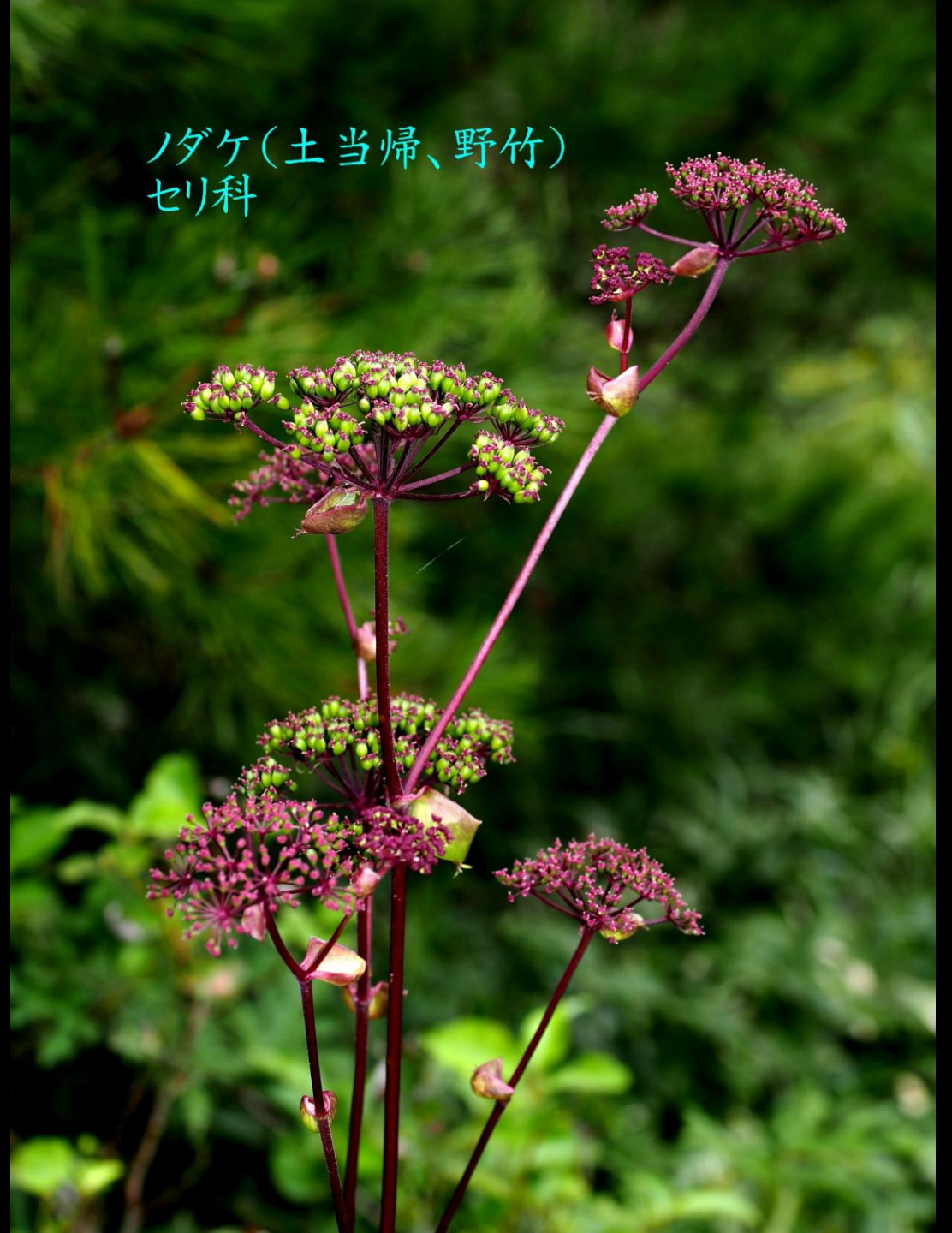
ノダケ(土当帰、野竹) セリ科