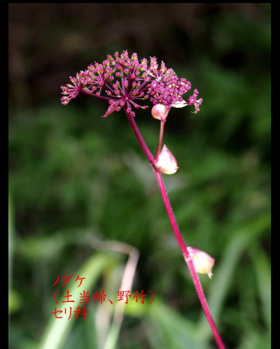
ノダケ (土当归、野竹) セリ科