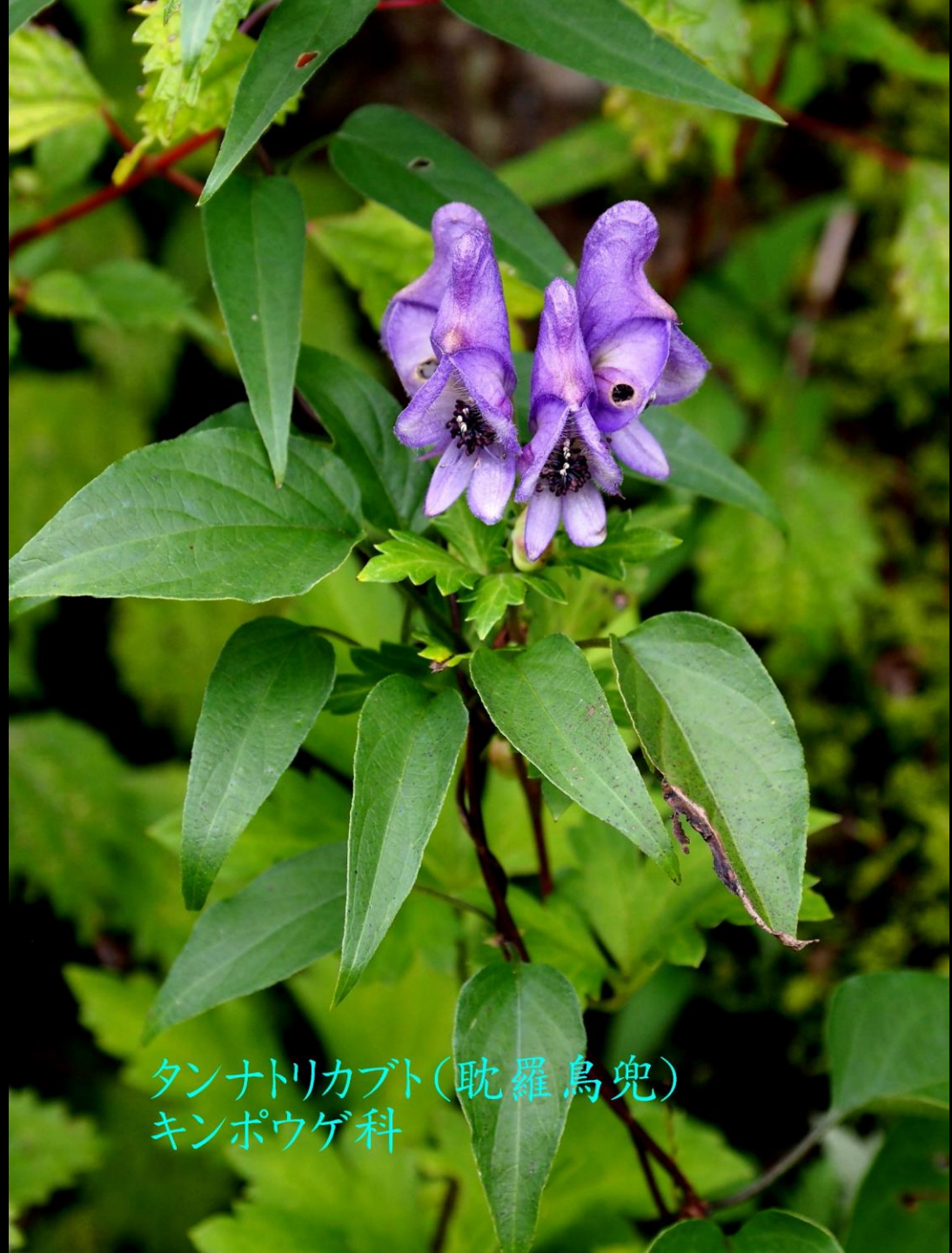
タンナトリカブト(耽羅烏兜) キンポウゲ科