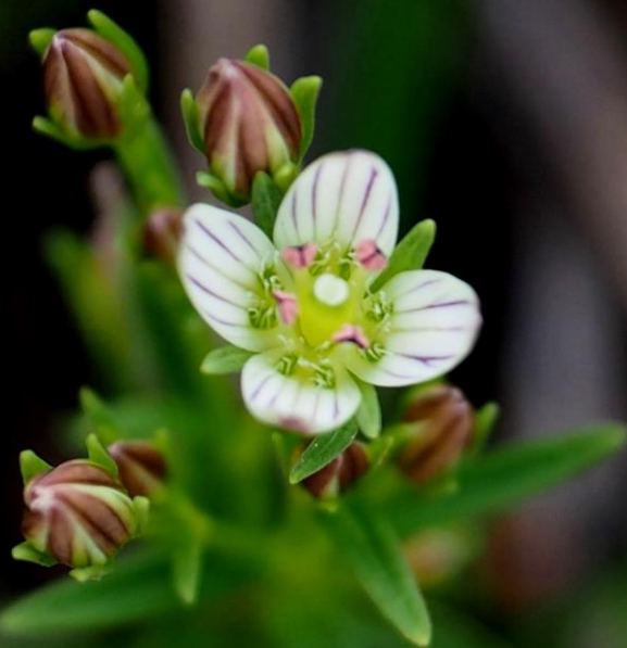
センブリ(千振) リンドウ科