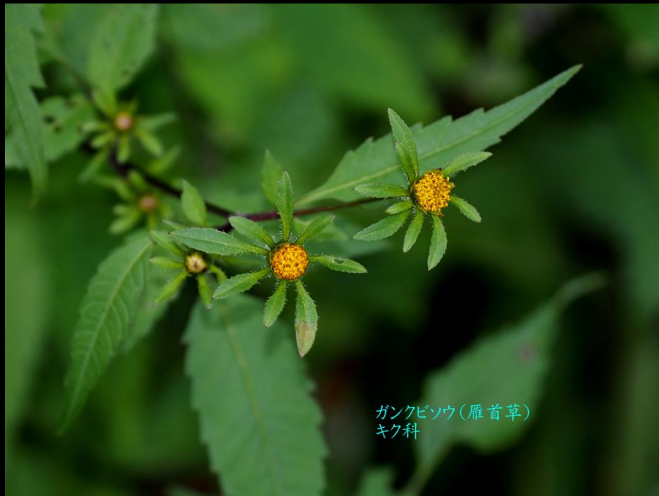
ガンクビソウ(雁首草) キク科