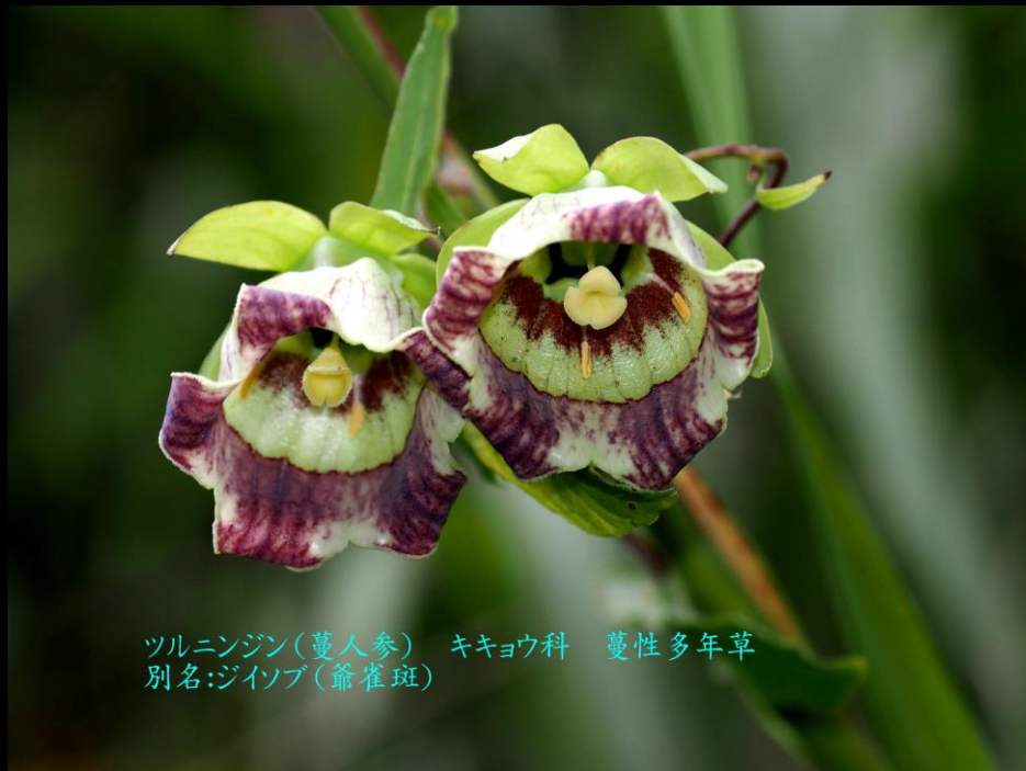
ツルニンジン(蔓人参) キキョウ科 蔓性多年草 別名:ジイソブ(爺雀斑)