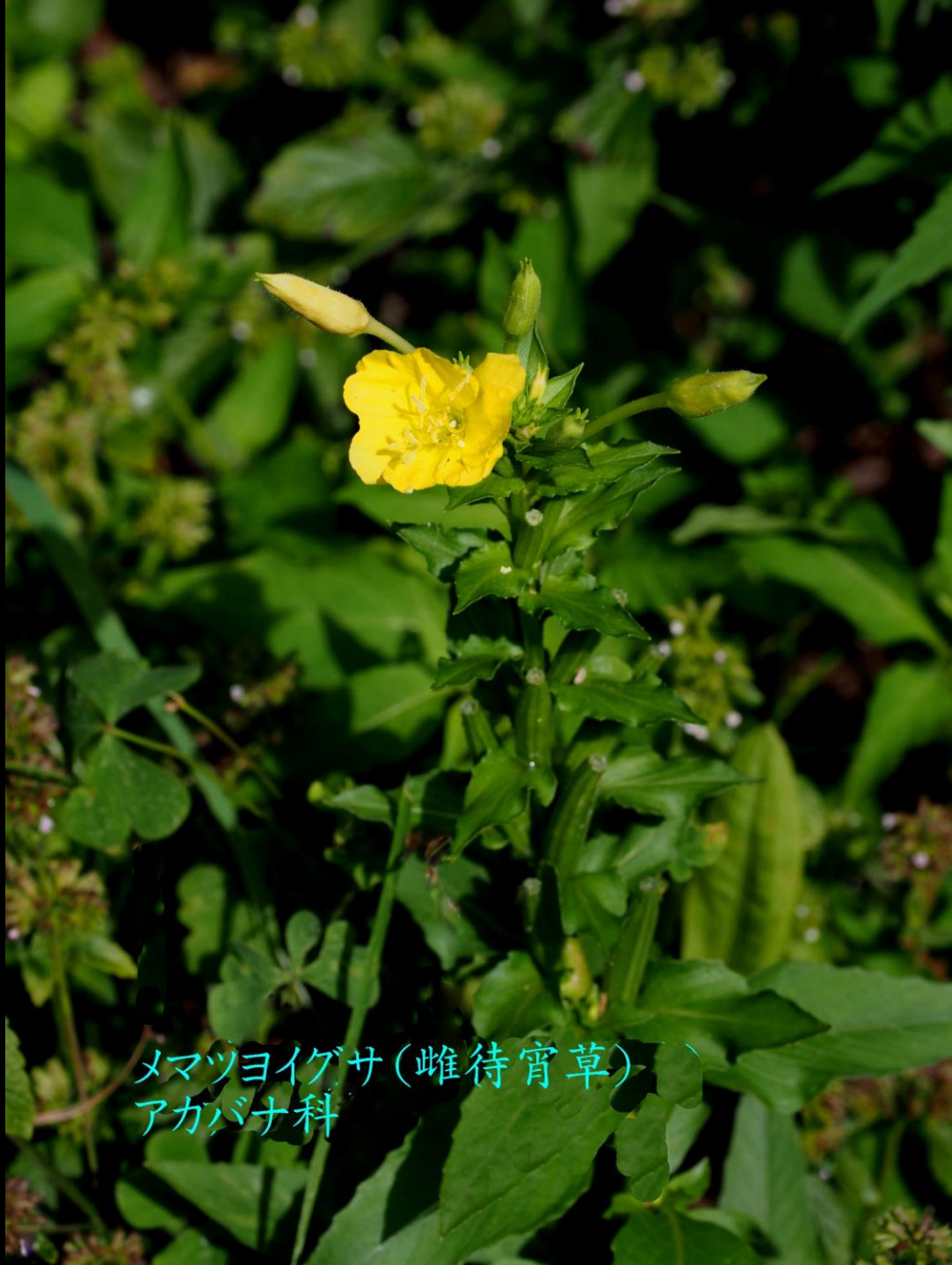
メマツヨイグサ(雌待宵草) アカバナ科