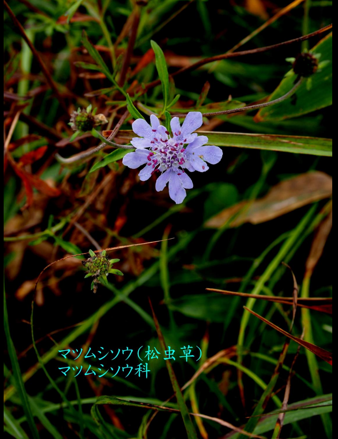
マツムシソウ(松虫草) マツムシソウ科