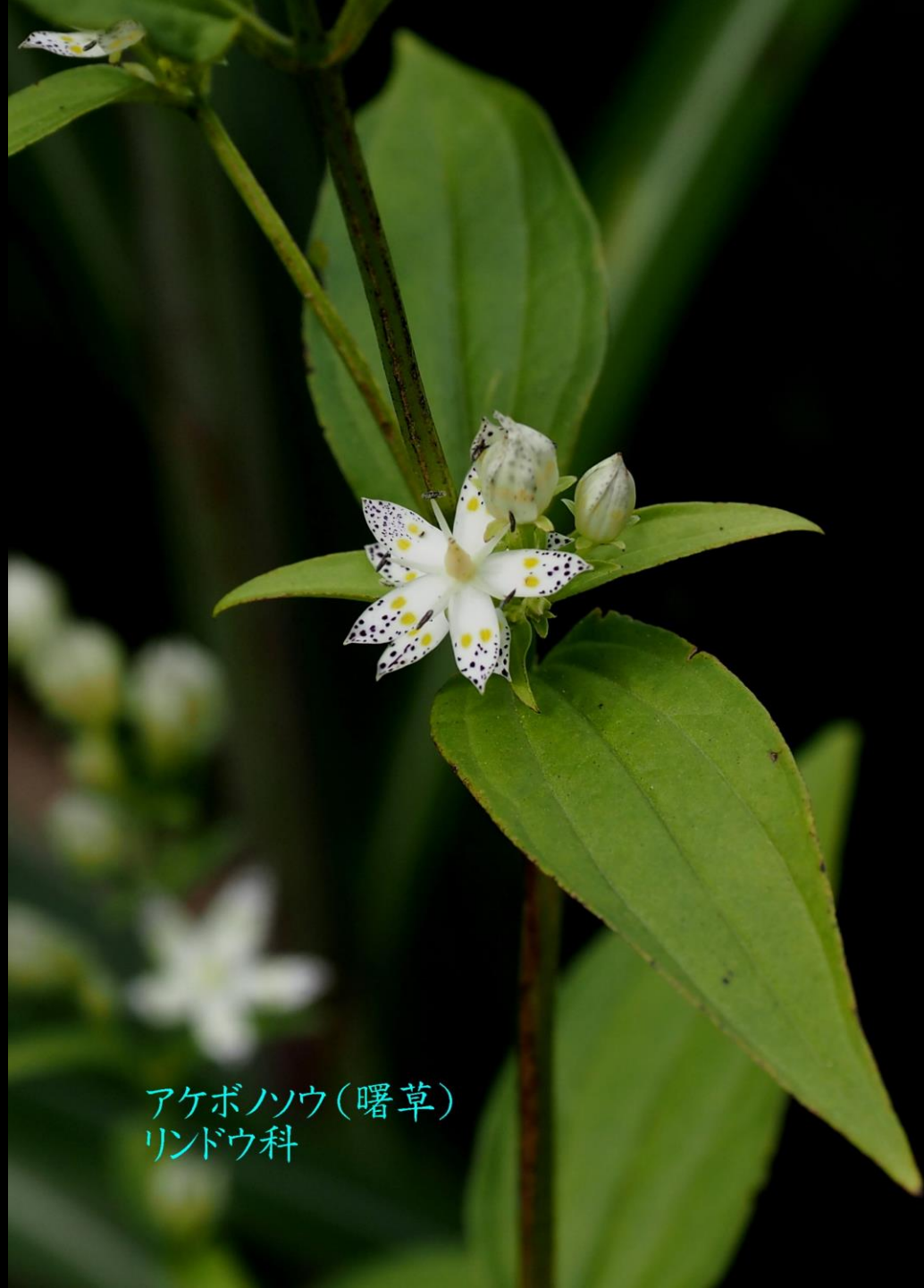
アケボノソウ(曙草) リンドウ科