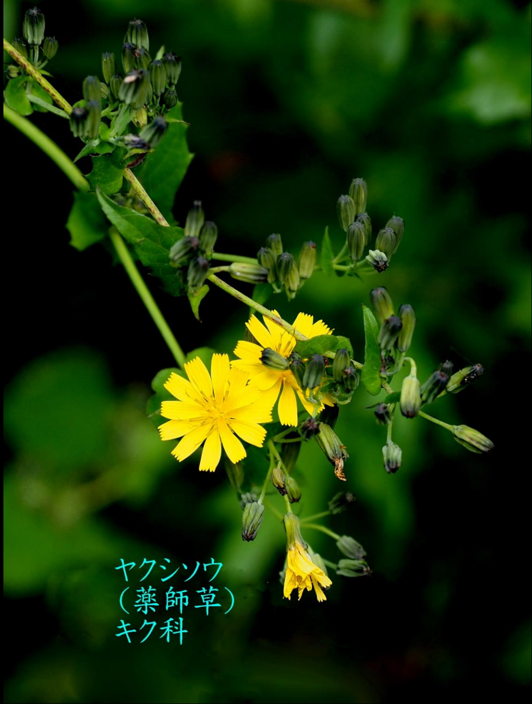
ヤクシソウ (薬師草) キク科