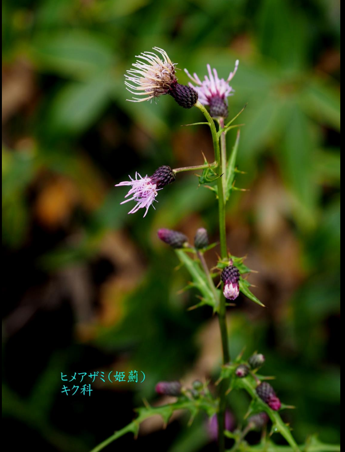
ヒメアザミ(姫薊) キク科