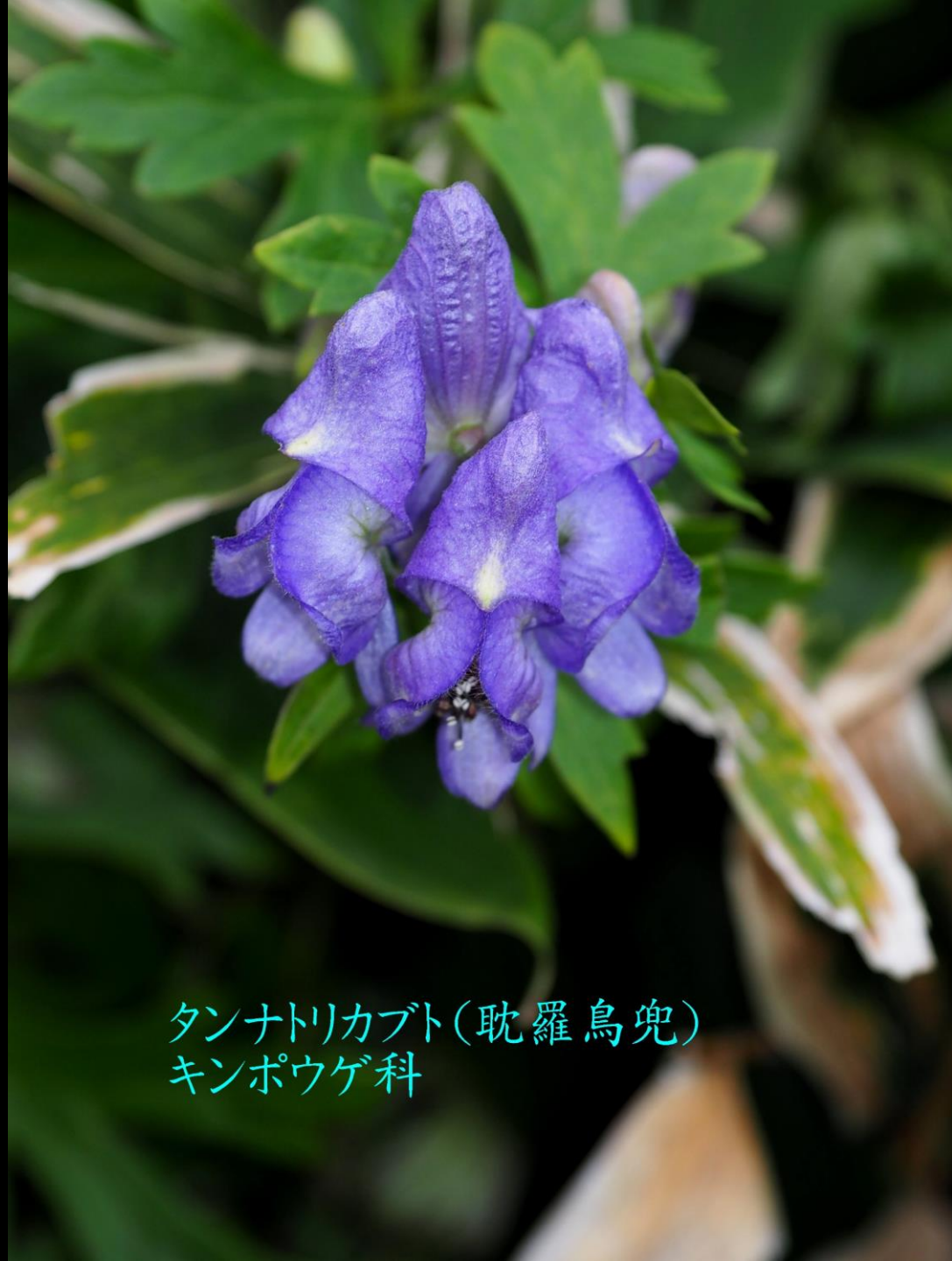
タンナトリカブト(耽羅烏兜) キンポウゲ科