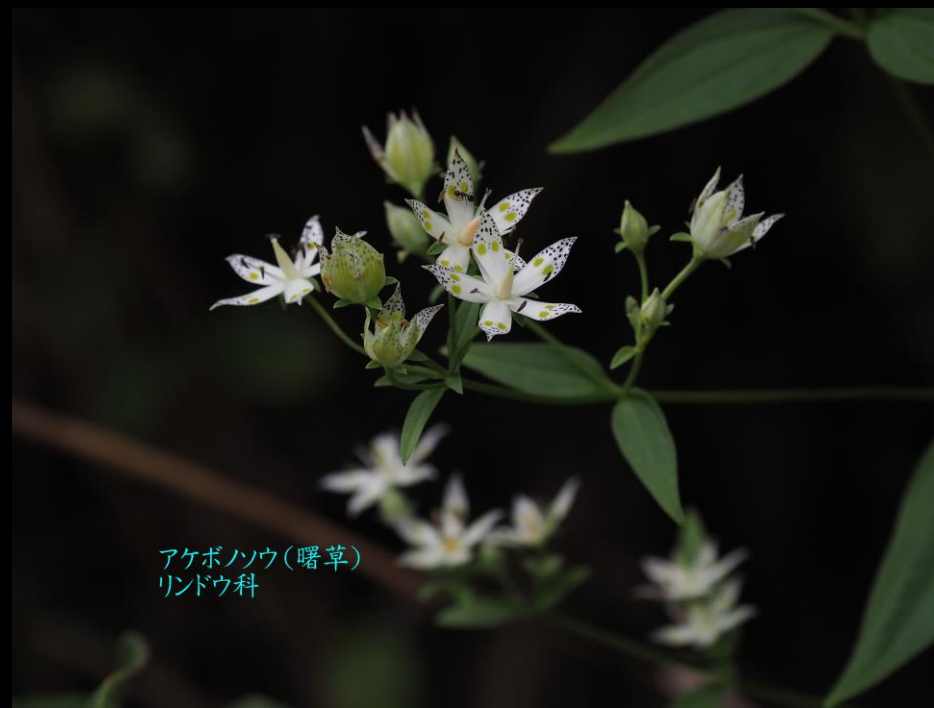
アケボノソウ(曙草) リンドウ科