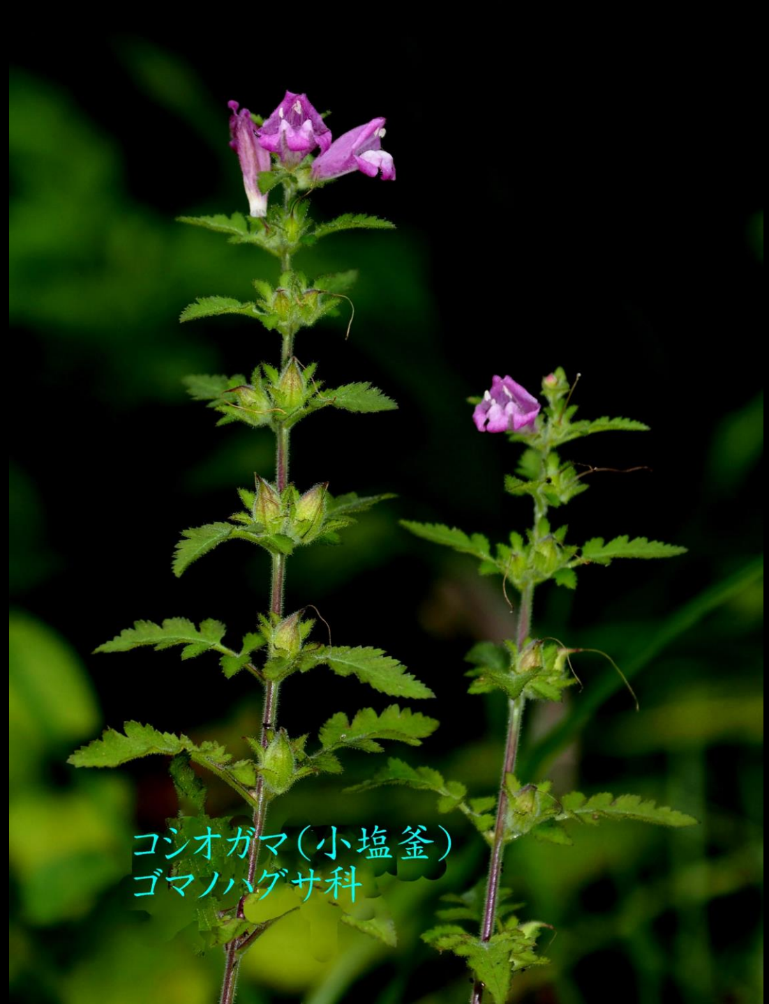
コシオガマ(小塩釜) ゴマノハグサ科