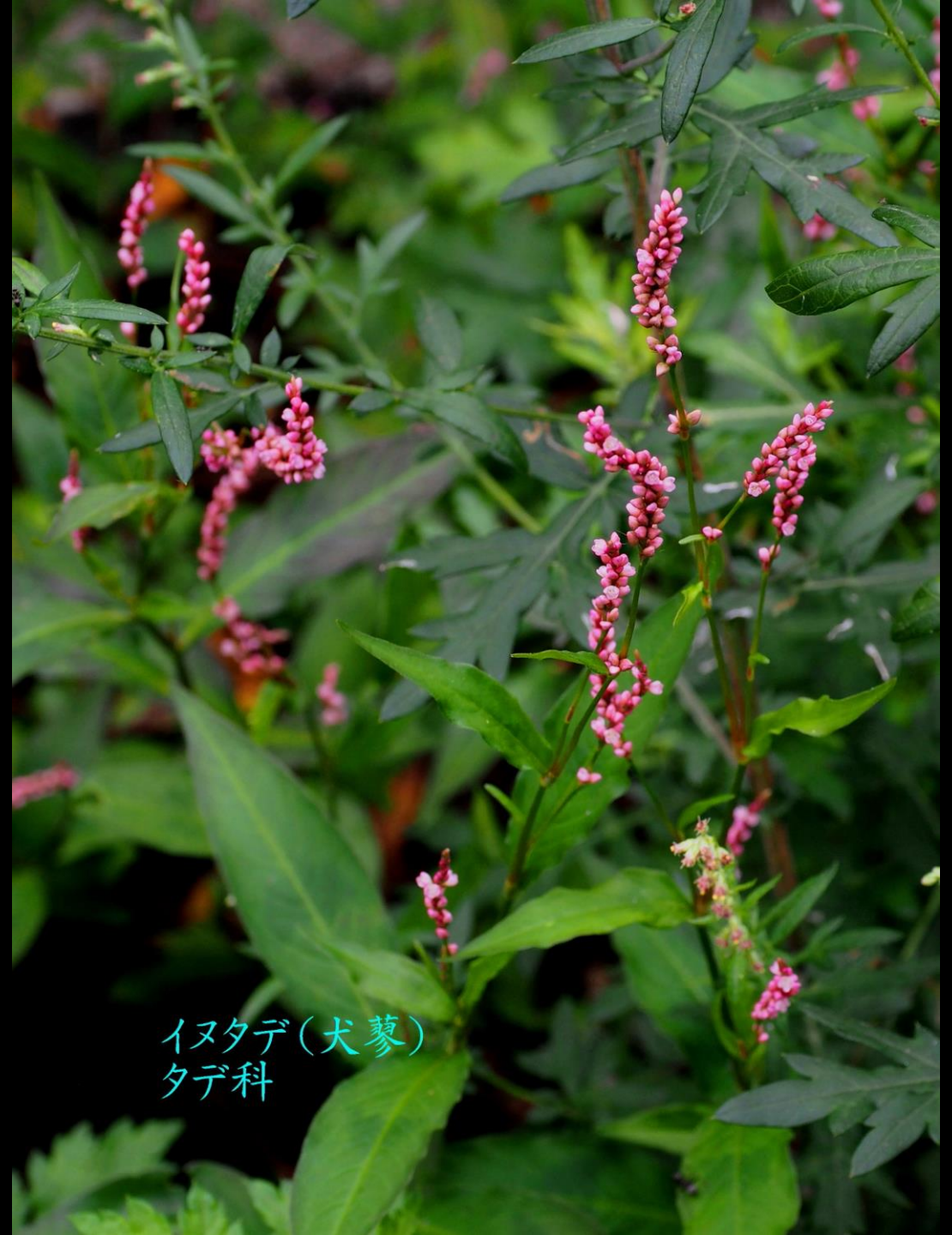
イヌタデ(犬蓼) タデ科