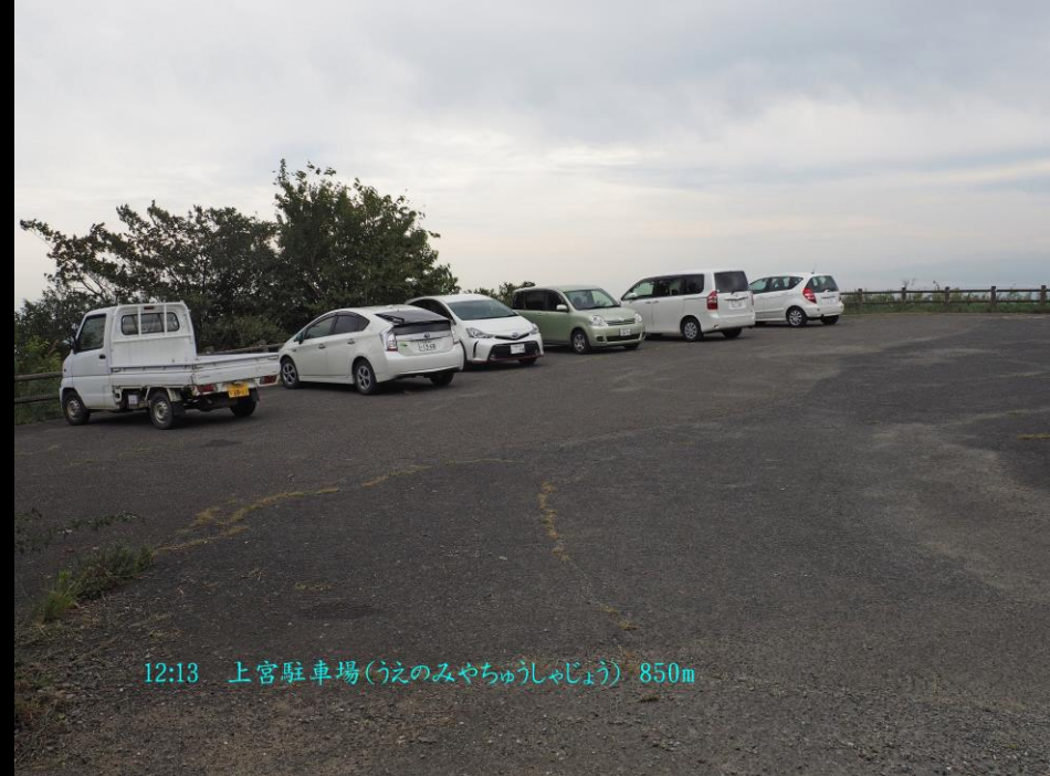
12:13 上宮駐車場(うへのみやちゅうしゃじょう) 850m