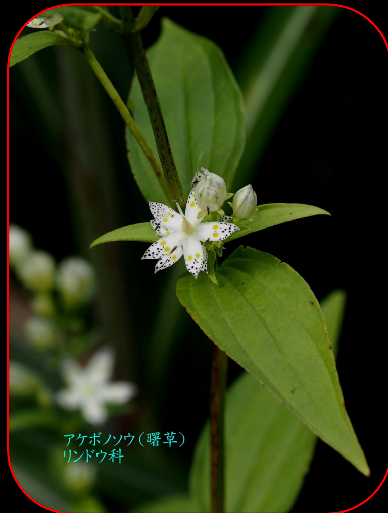
アケボノソウ(曙草) リンドウ科