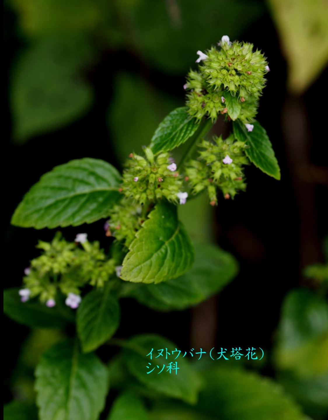
イヌウバナ(犬塔花) シソ科