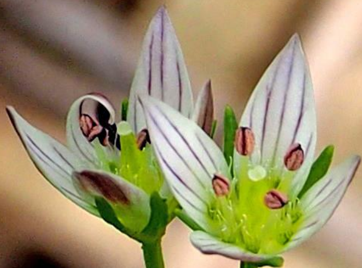
センブリ(千振) リンドウ科