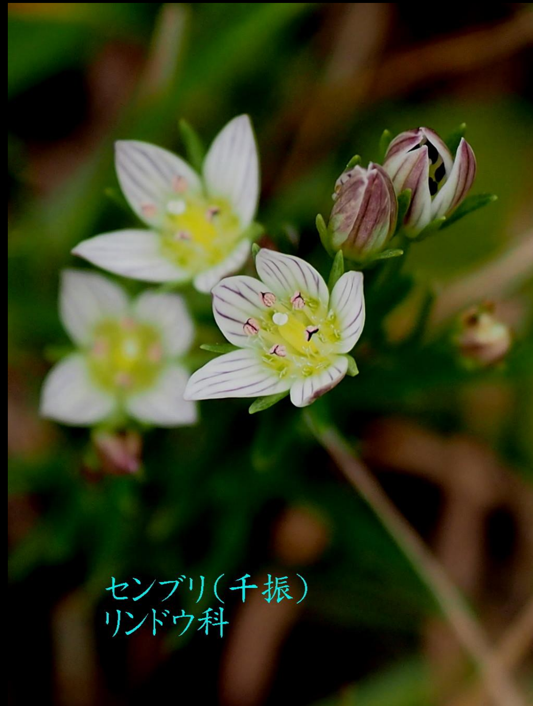
センブリ(千振) リンドウ科