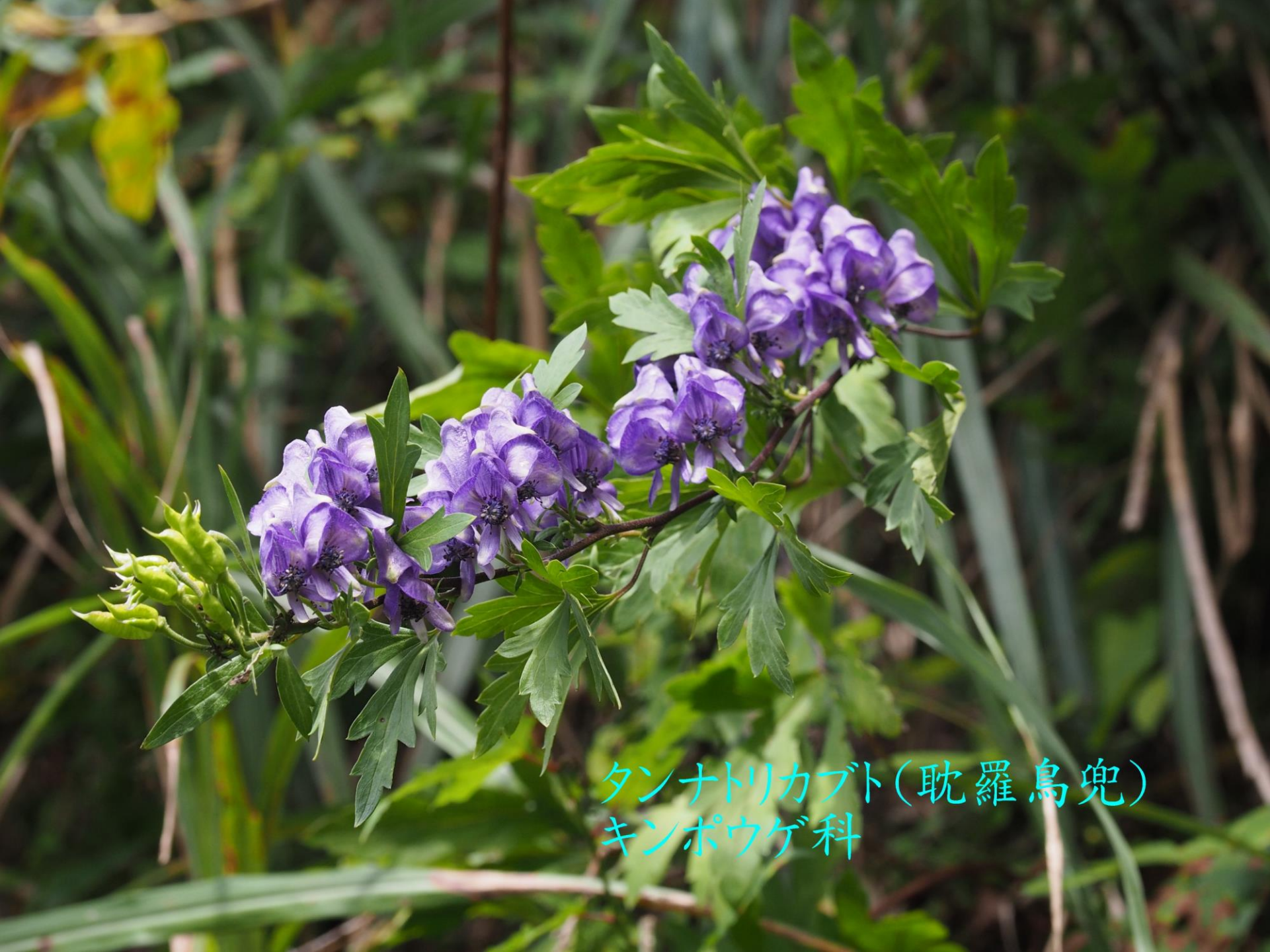
タンナトリカブト(耽羅烏兜) キンポウゲ科