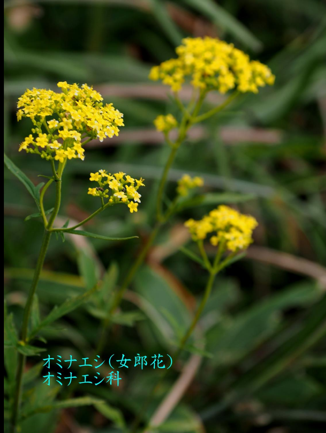
オミナエシ(女郎花) オミナエシ科