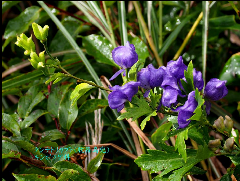
タンナトリカブト(耽羅烏兜) キンポウゲ科