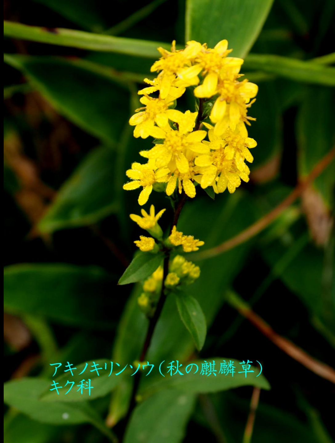
アキノキリンソウ(秋の麒麟草) キク科