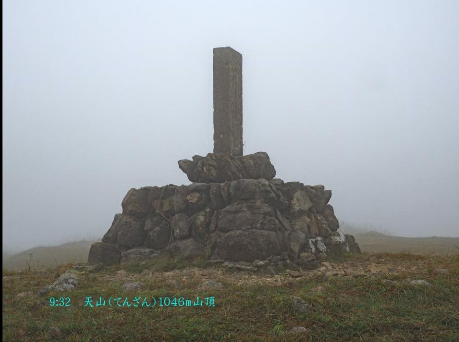
9:32 天山(てんざん)1046m山頂