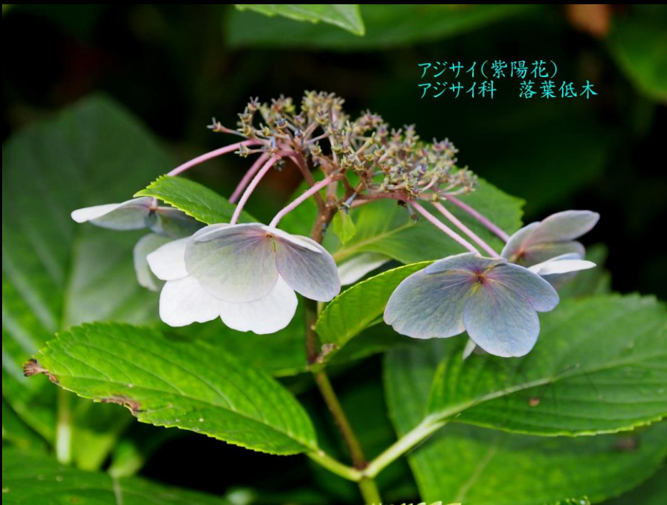
アジサイ(紫陽花) アジサイ科 落葉低木