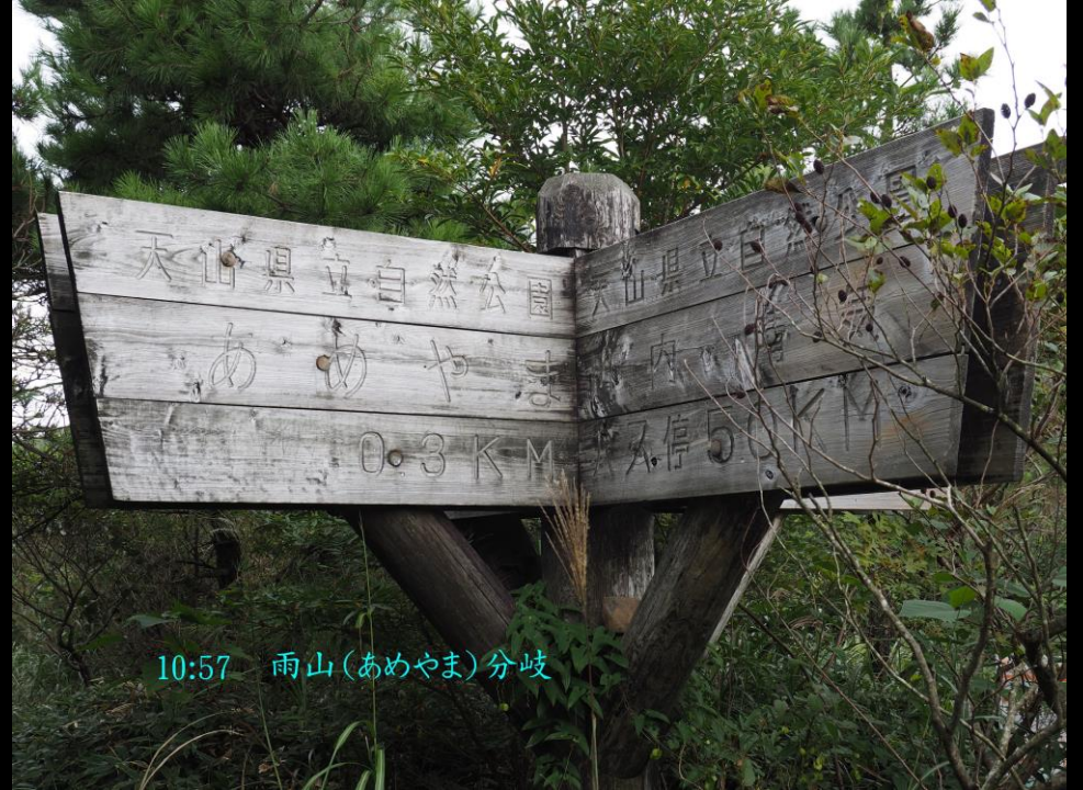
10:57 雨山(あめやま)分岐