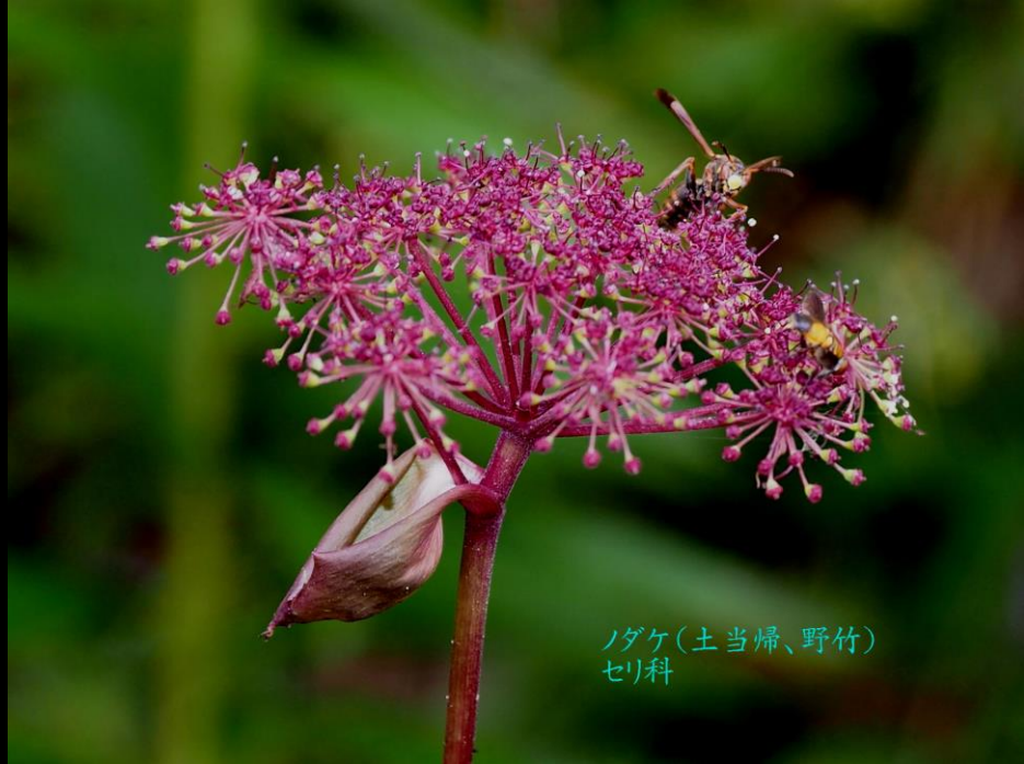
ノダケ(土当帰、野竹) セリ科