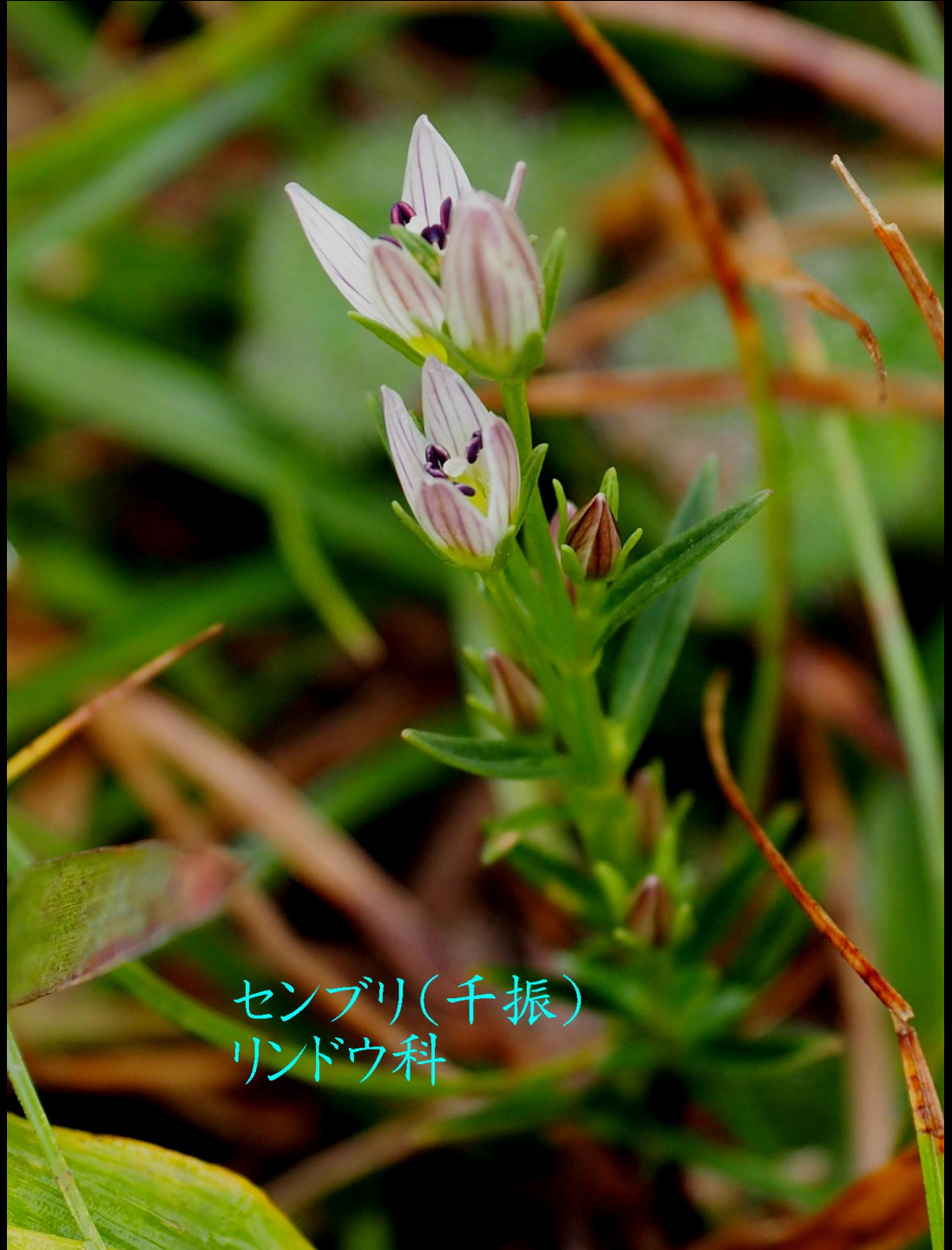
センブリ(千振) リンドウ科