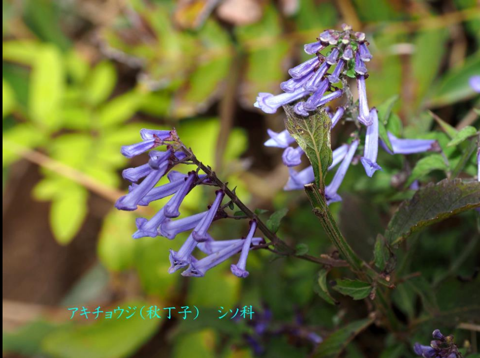
アキチヨウジ(秋丁子) シソ科