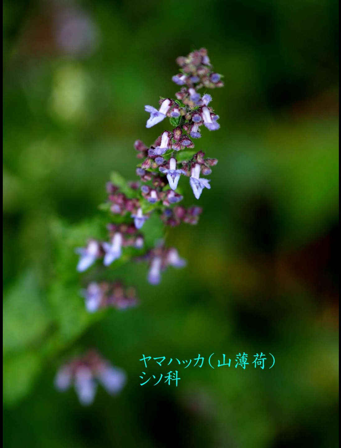
ヤマハッカ(山薄荷) シソ科