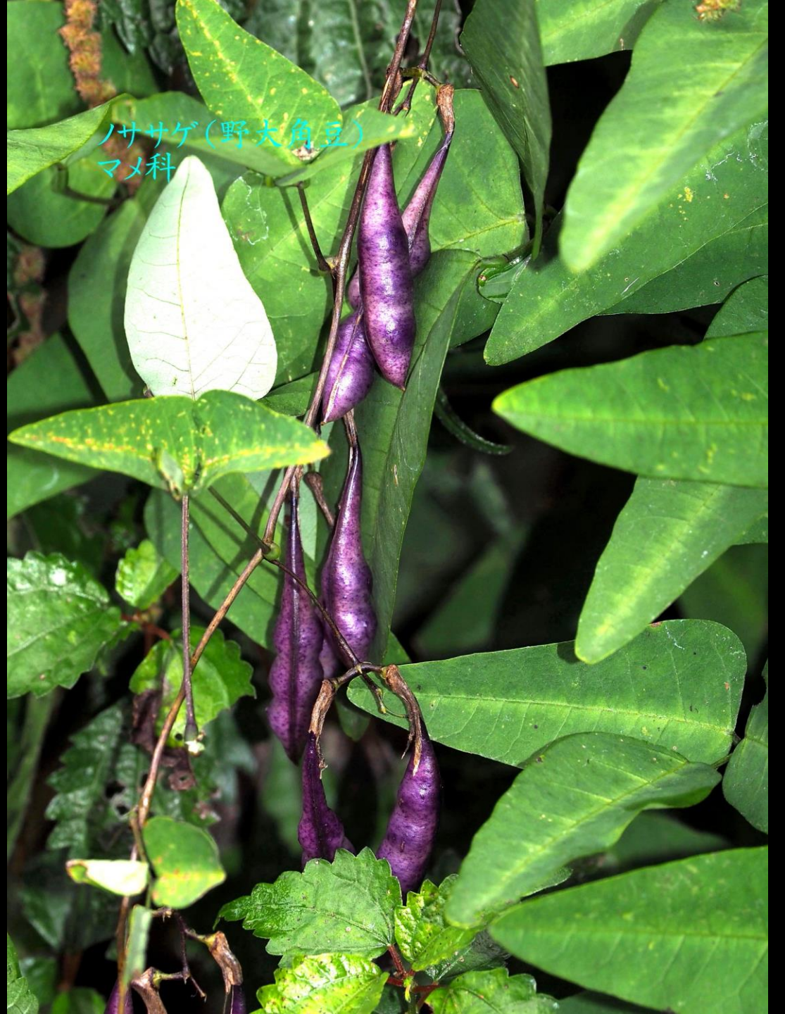
ノササゲ(野大角豆) マメ科