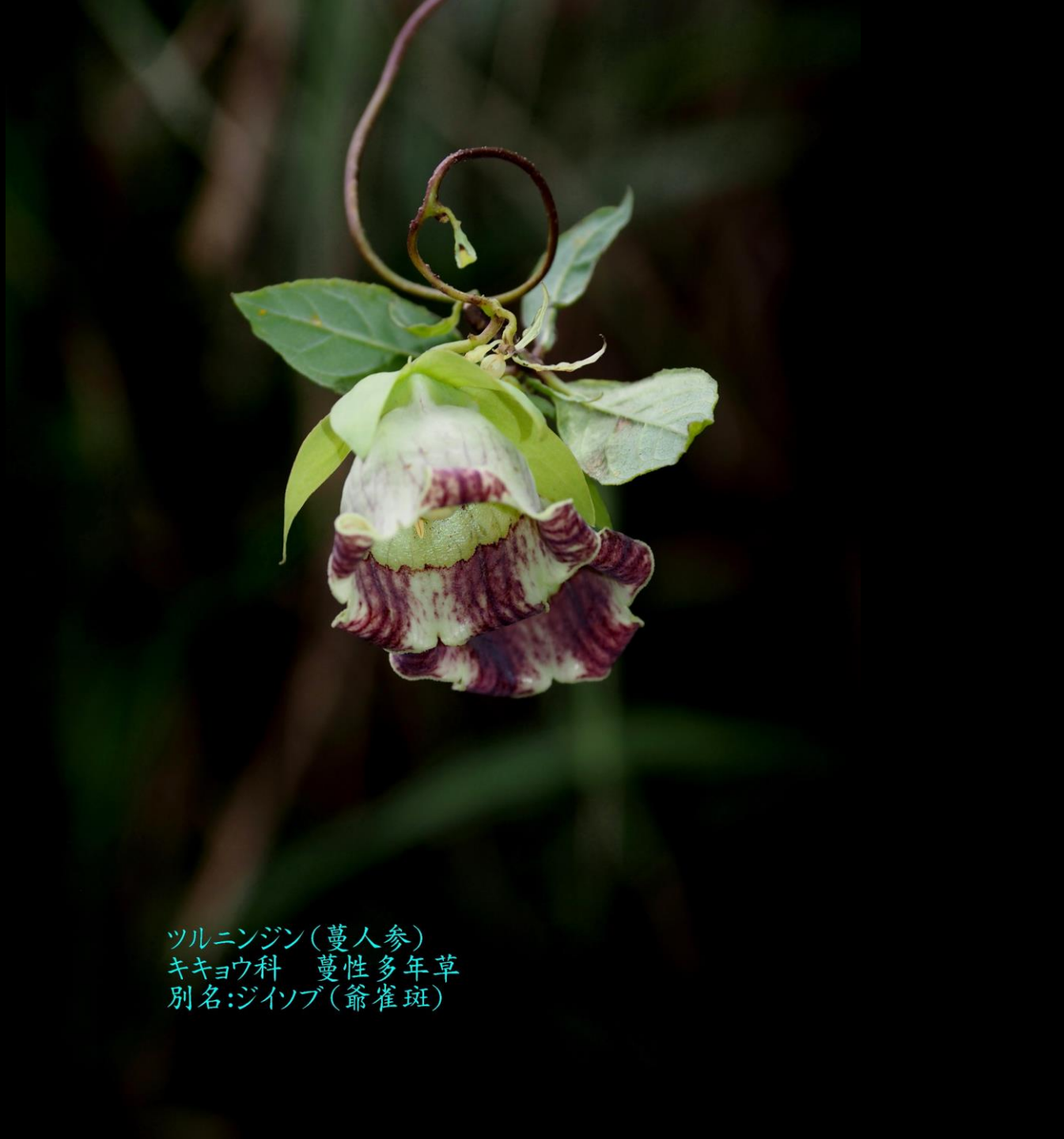
ツルニンジン(蔓人参) キキョウ科 蔓性多年草 別名:ジイソブ(爺雀斑)