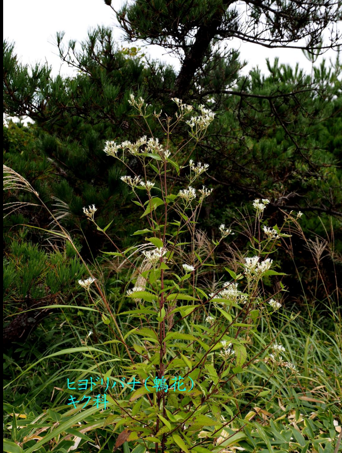
ヒヨドリバナ(鶉花) キク科