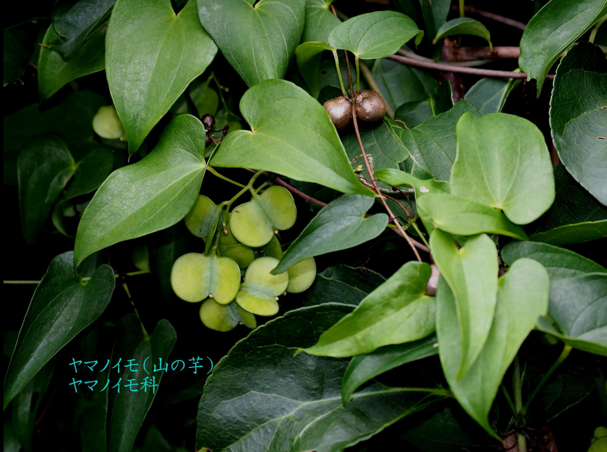
ヤマノイモ(山の芋) ヤマノイモ科