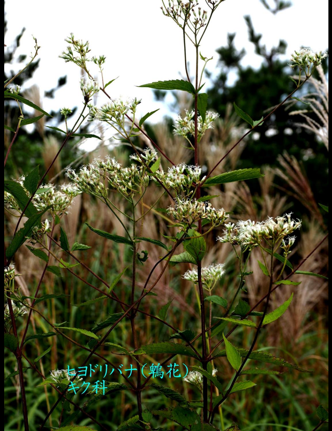
ヒヨドリバナ(鶉花) キク科