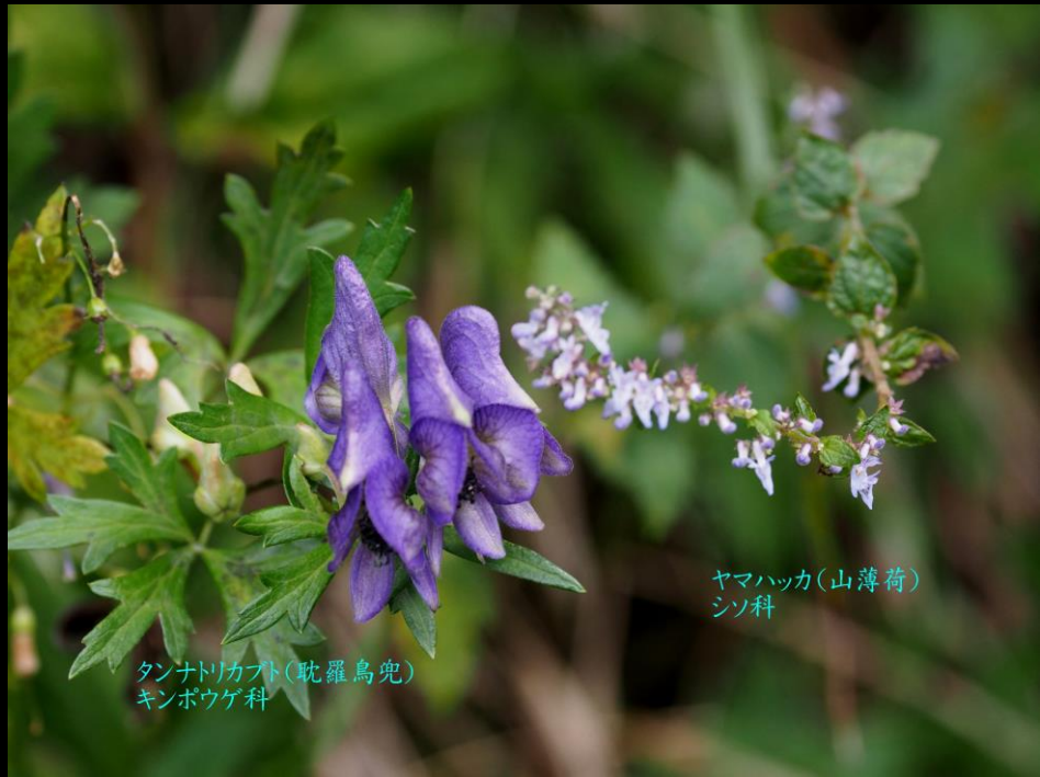
タンナトリカブト(耽羅烏兜) キンボウゲ科