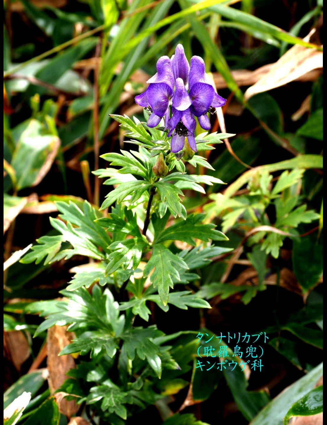
タンナトリカブト (耽羅烏兜) キンポウゲ科