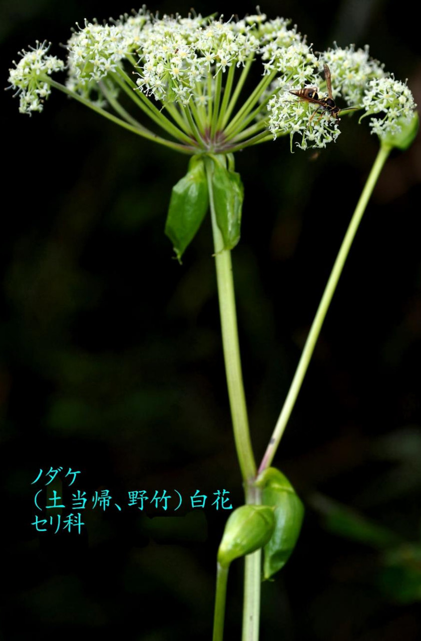
ノダケ (土当归、野竹) 白花 セリ科