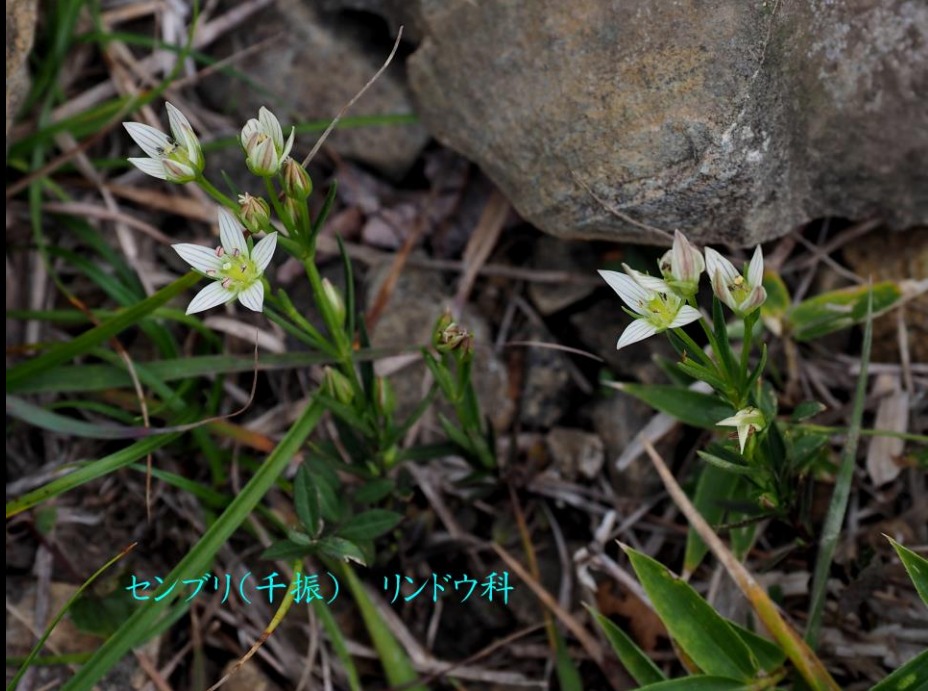
センブリ(千振) リンドウ科