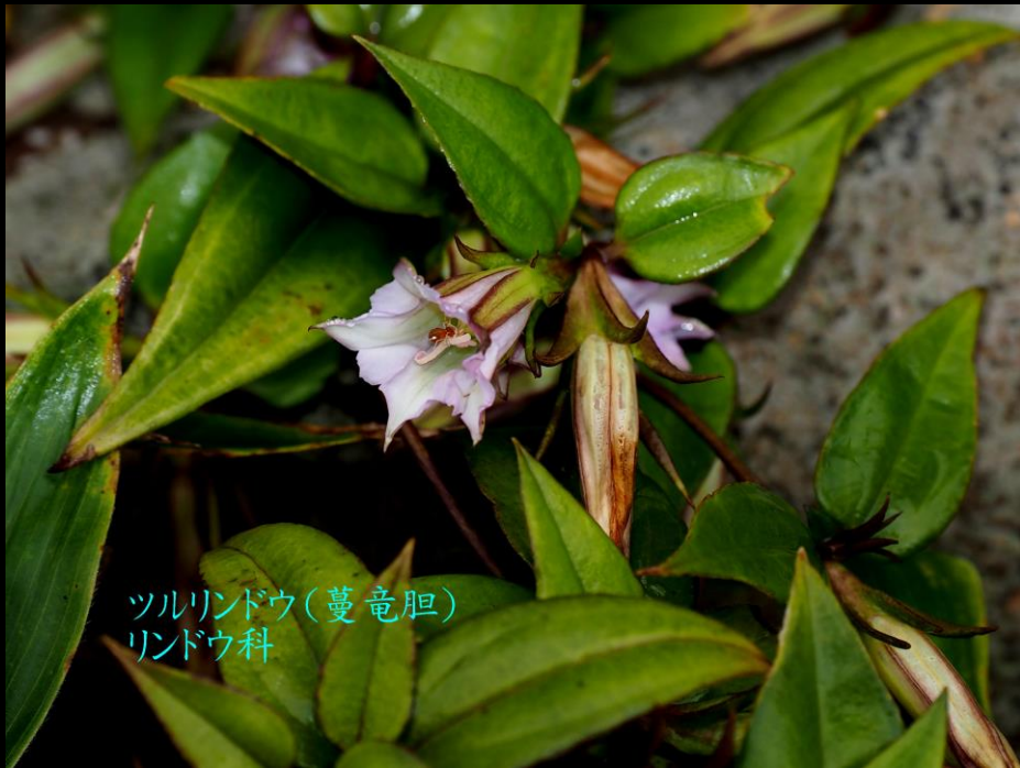
ツルリンドウ(蔓竜胆) リンドウ科