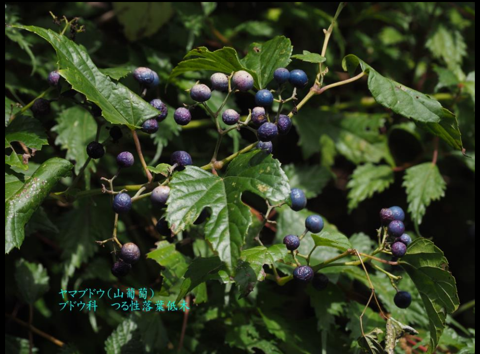
ヤマブドウ(山葡萄) ブドウ科 つる性落葉低木