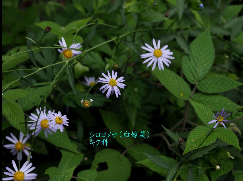
シロヨメナ(白嫁菜) キク科