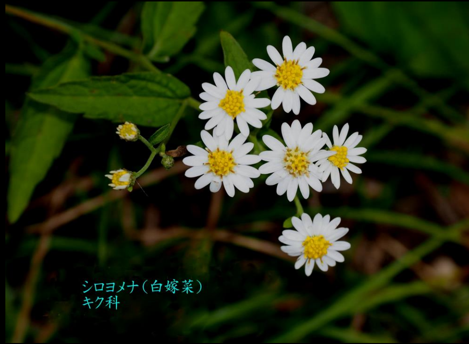
シロヨメナ(白嫁菜) キク科