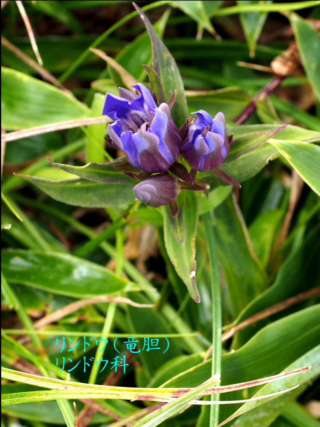
リンドウ(竜胆) リンドウ科