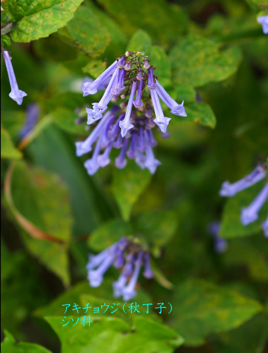
アキチョウジ(秋丁子) シソ科