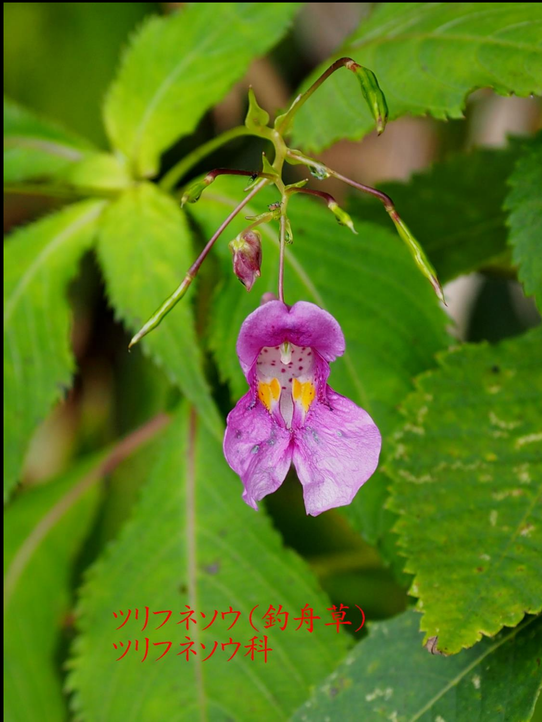
ツリフネソウ(釣舟草) ツリフネソウ科