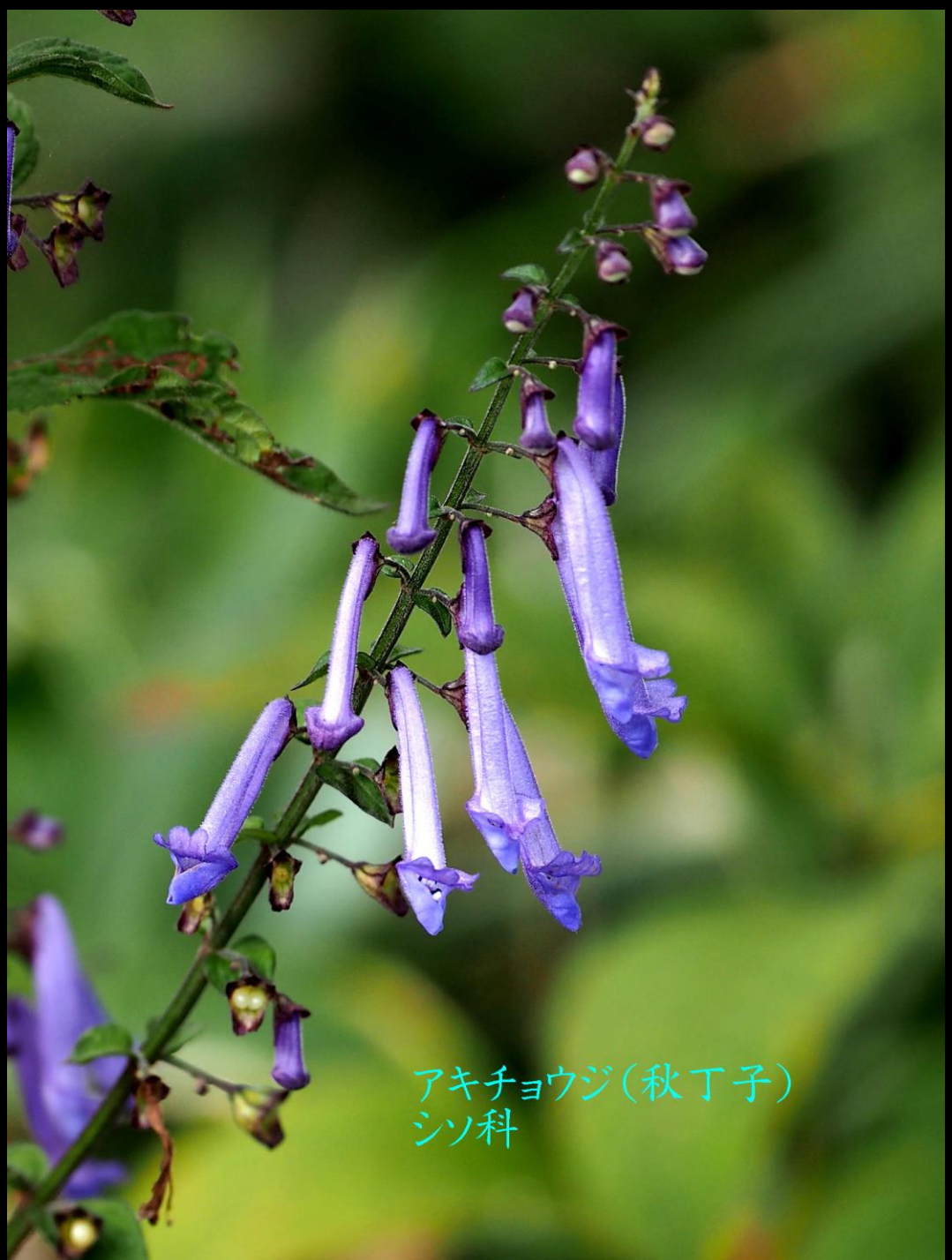
アキチヨウジ(秋丁子) シソ科