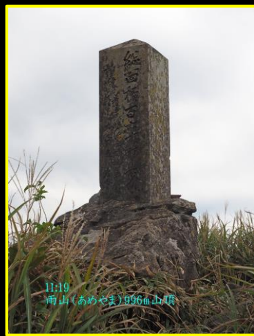
11:19 雨山(あめやま)996m山頂