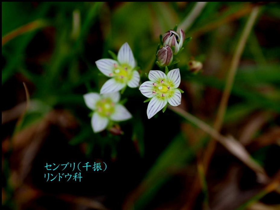
センブリ(千振) リンドウ科