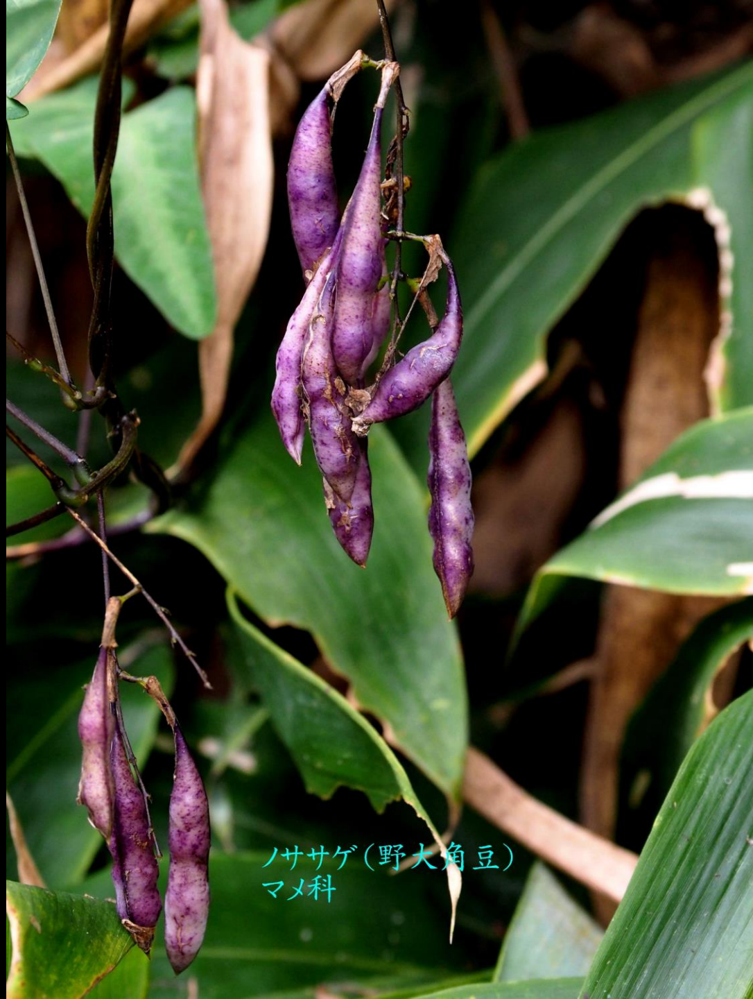
ノササゲ(野大角豆) マメ科