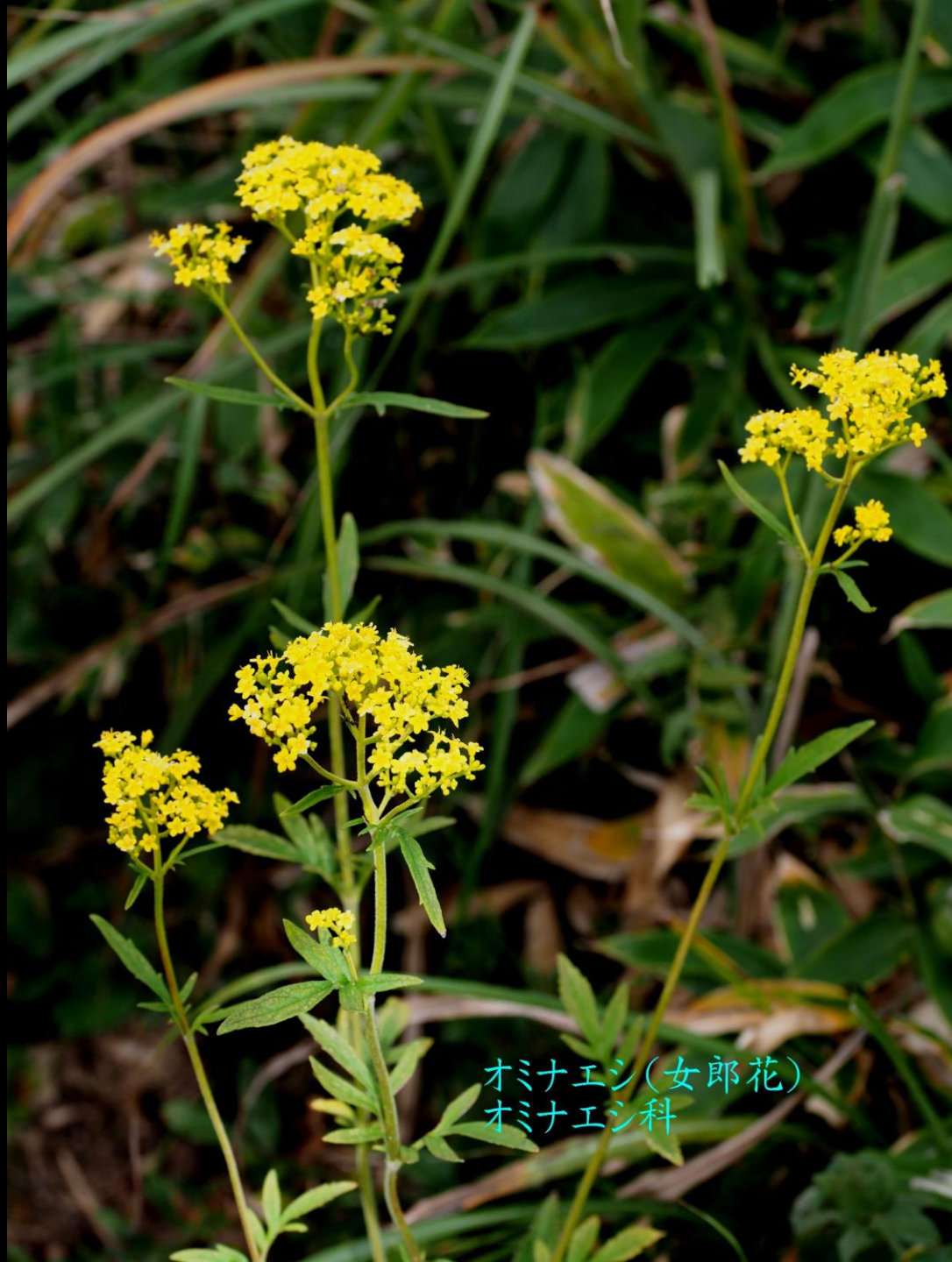
オミナエシ(女郎花) オミナエシ科