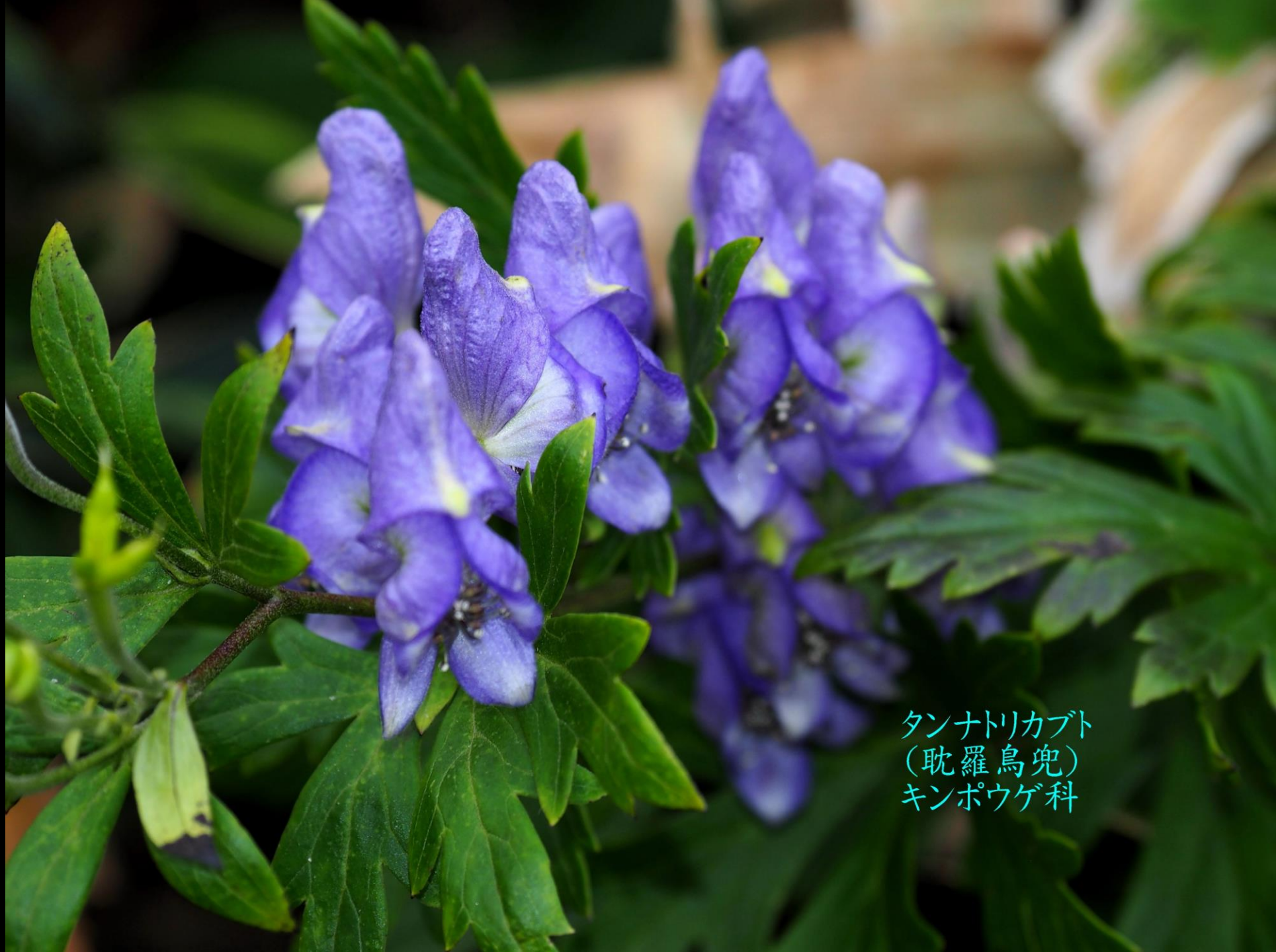
タンナトリカブト (耽羅烏兜) キンポウゲ科