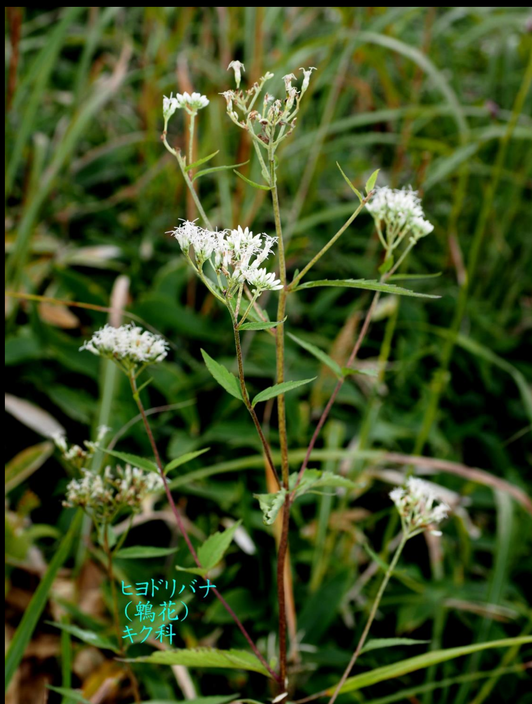
ヒヨドリバナ (鶉花) キク科