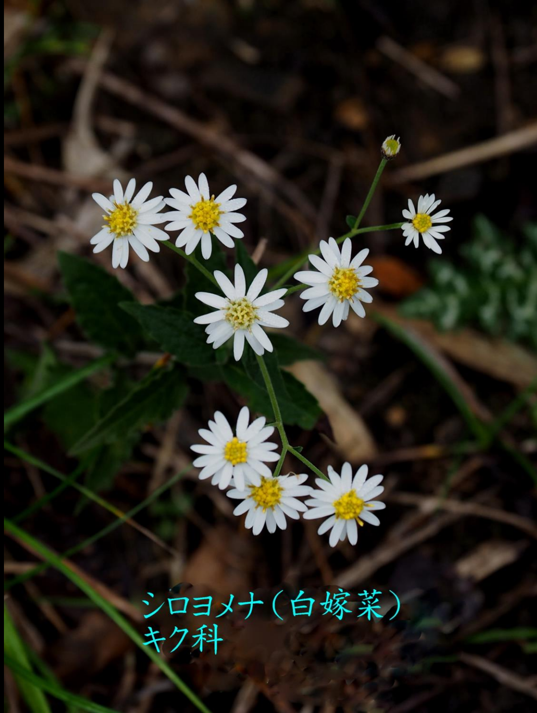
シロヨメナ(白嫁菜) キク科