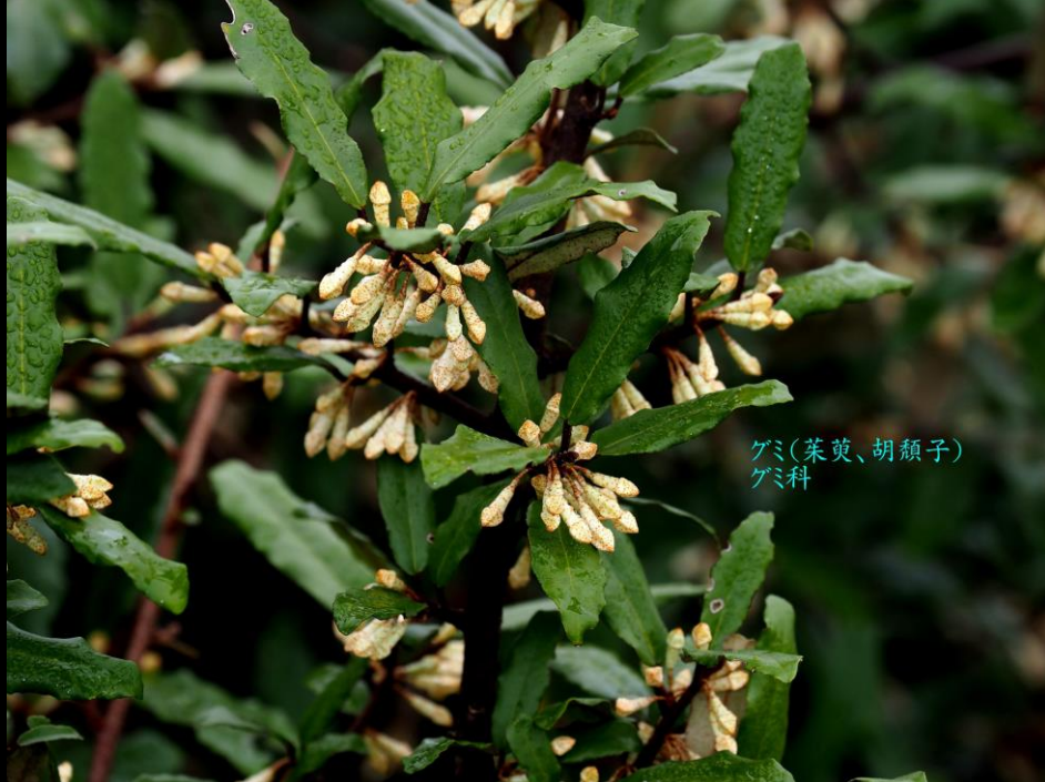
ゲミ(茱萸、胡頹子) ゲミ科