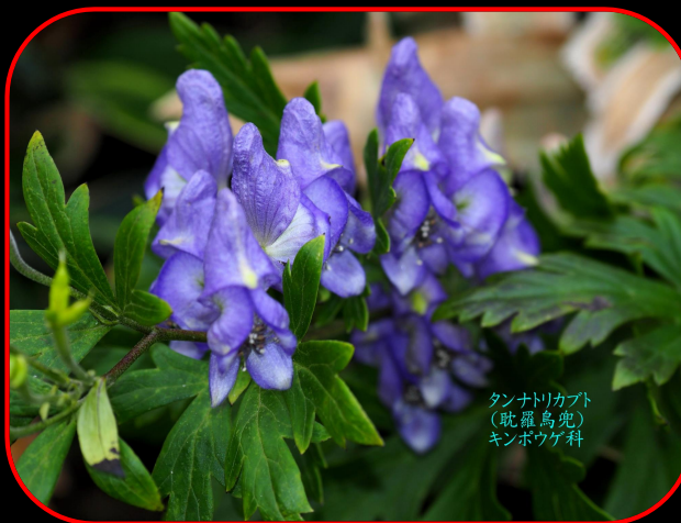
タンナトリカブト (耽羅烏兜) キンポウゲ科

天川駐車場（あまがわちゅうしゃじょう）900m ～天山(てんざん)1046m～雨山分岐 ～雨山(あめやま)996m～雨山分岐 ～上宮駐車場(うえのみやちゅうしゃじょう)850m ～林道畑田～天川線 ～天川（あまがわ）駐車場900mの周回ルート