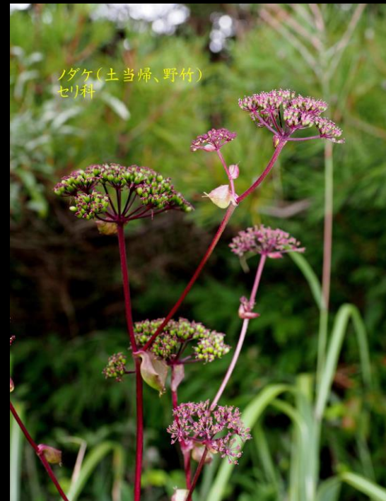
ノダケ(土当归、野竹) セリ科