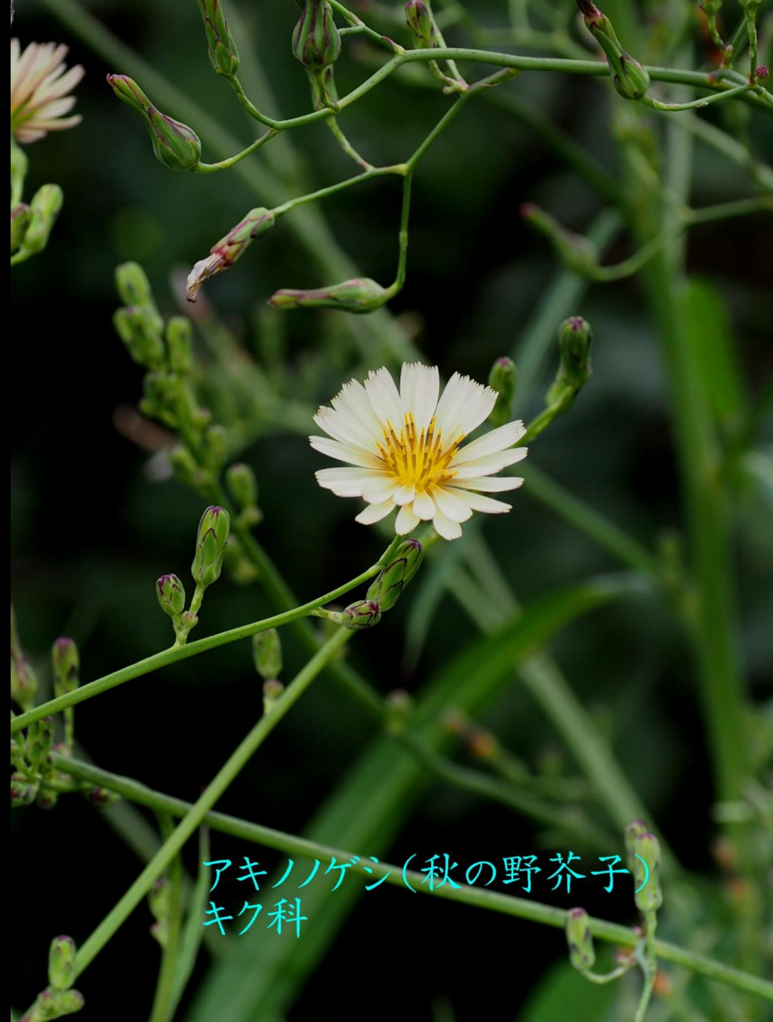
アキノゲシ(秋の野芥子) キク科