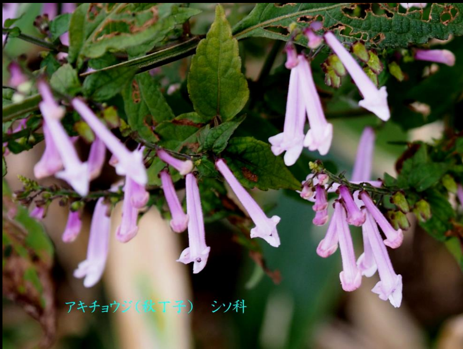
アキチヨウジ(秋丁子) シソ科