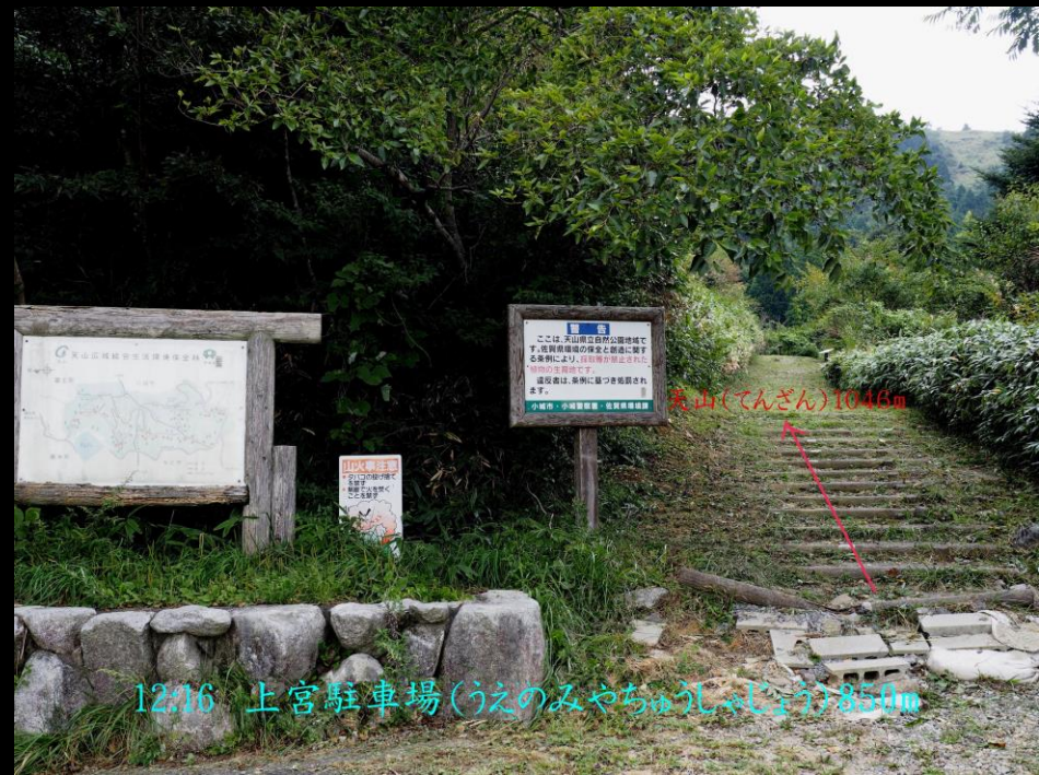
12:16 上宮駐車場(うへのみやちゅうしゃじょう) 850m