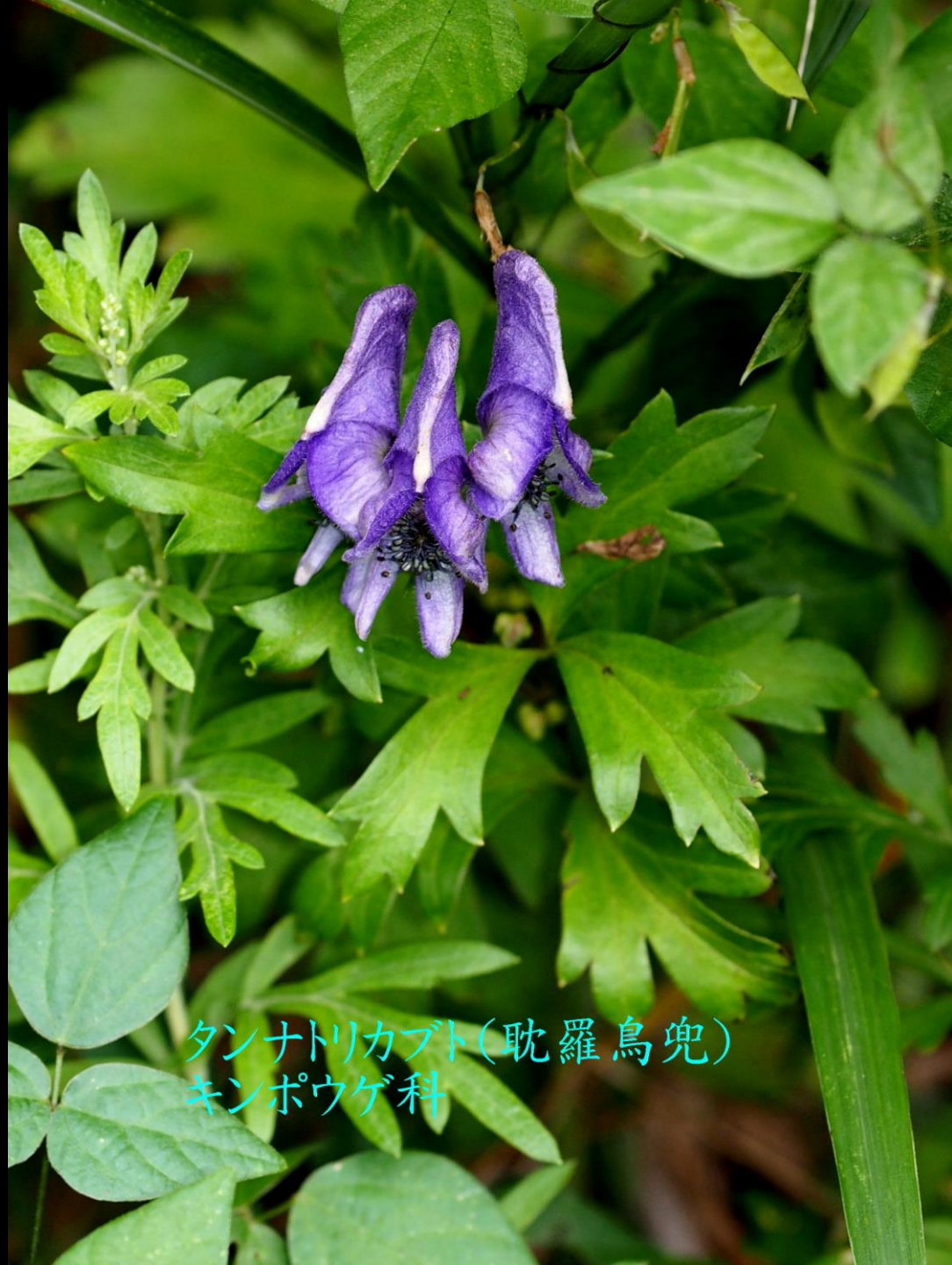
タンナトリカブト(耽羅烏兜) キンポウゲ科