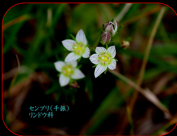
センブリ(千振) リンドウ科