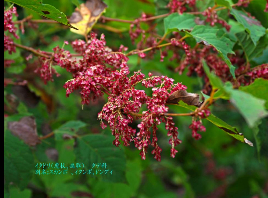
イタドリ(虎杖、痛取) タデ科 別名;スカンポ、イタンポ、ドンゲイ