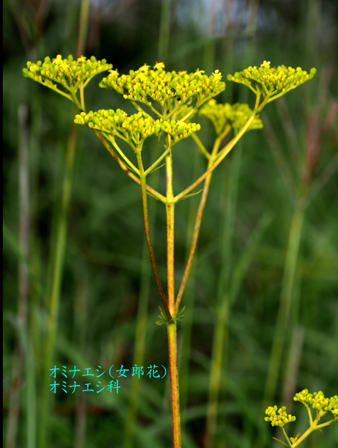
オミナエシ(女郎花) オミナエシ科