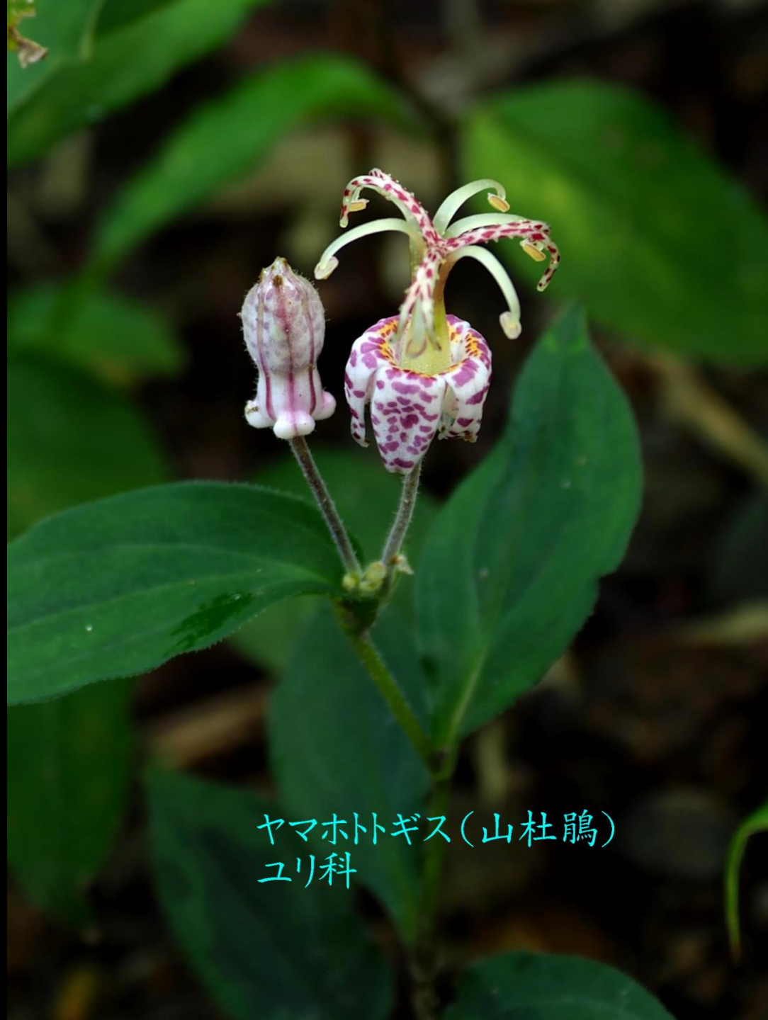
ヤマホトギス(山杜鵑) ユリ科