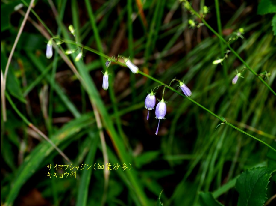
サイヨウシャジン(細葉沙参) キキョウ科