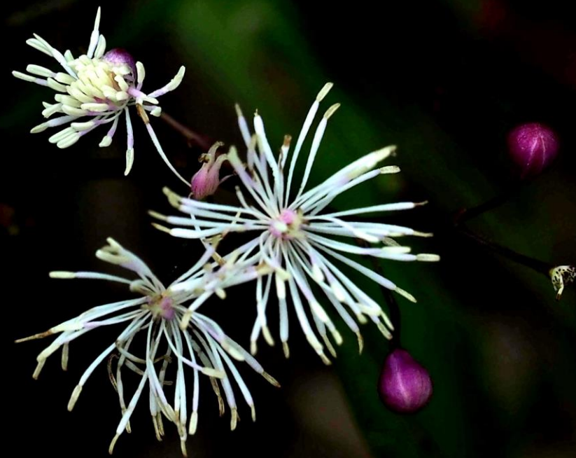
シギンカラマツ (紫銀唐松) キンポウゲ科