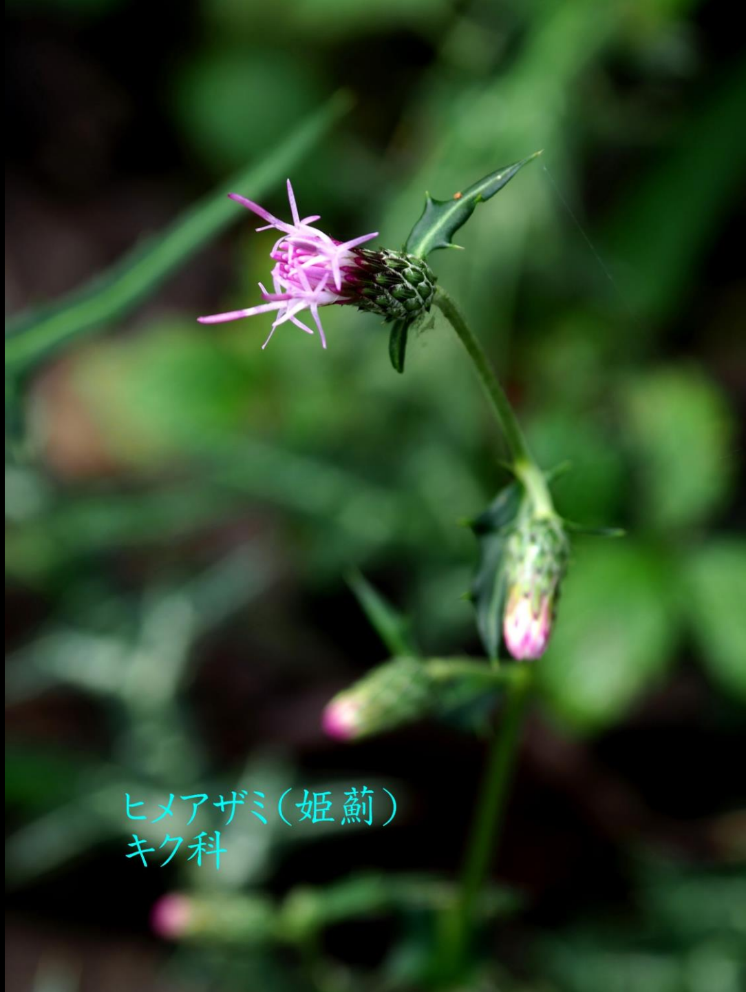
ヒメアザミ(姫薊) キク科