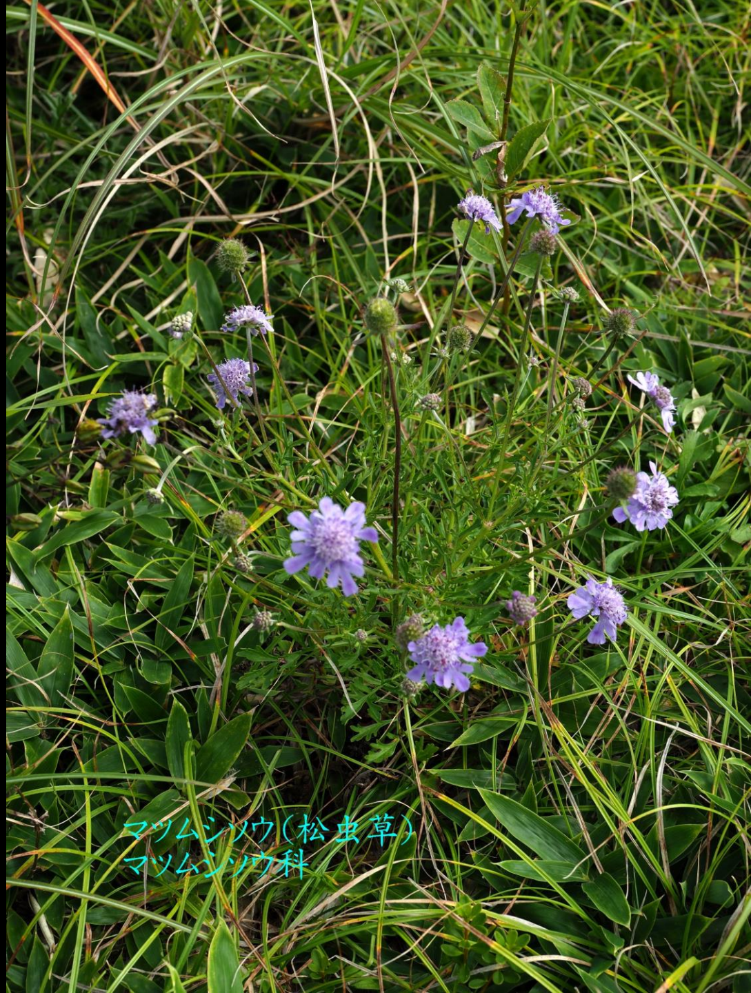
マツムシソウ(松虫草) マツムシソウ科