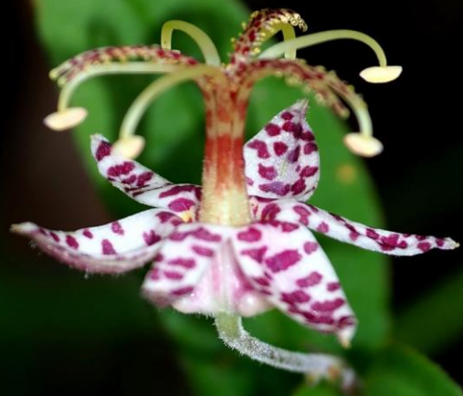
ヤマジノホトギス (山路の杜鵑) ユリ科