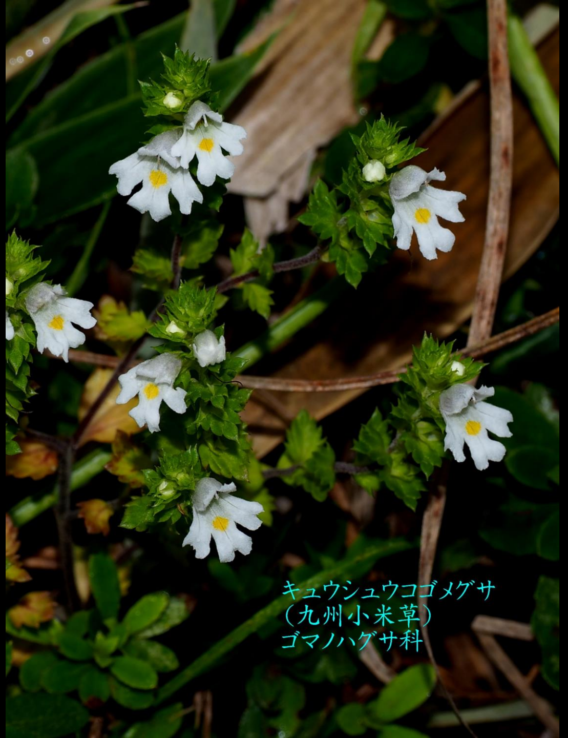
キュウシュウコゴメグサ (九州小米草) ゴマノハグサ科