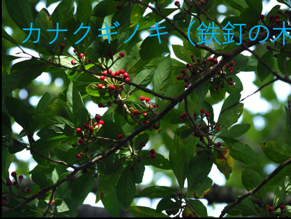
カナクギノキ (鉄釘の木) クスノキ科 落葉高木