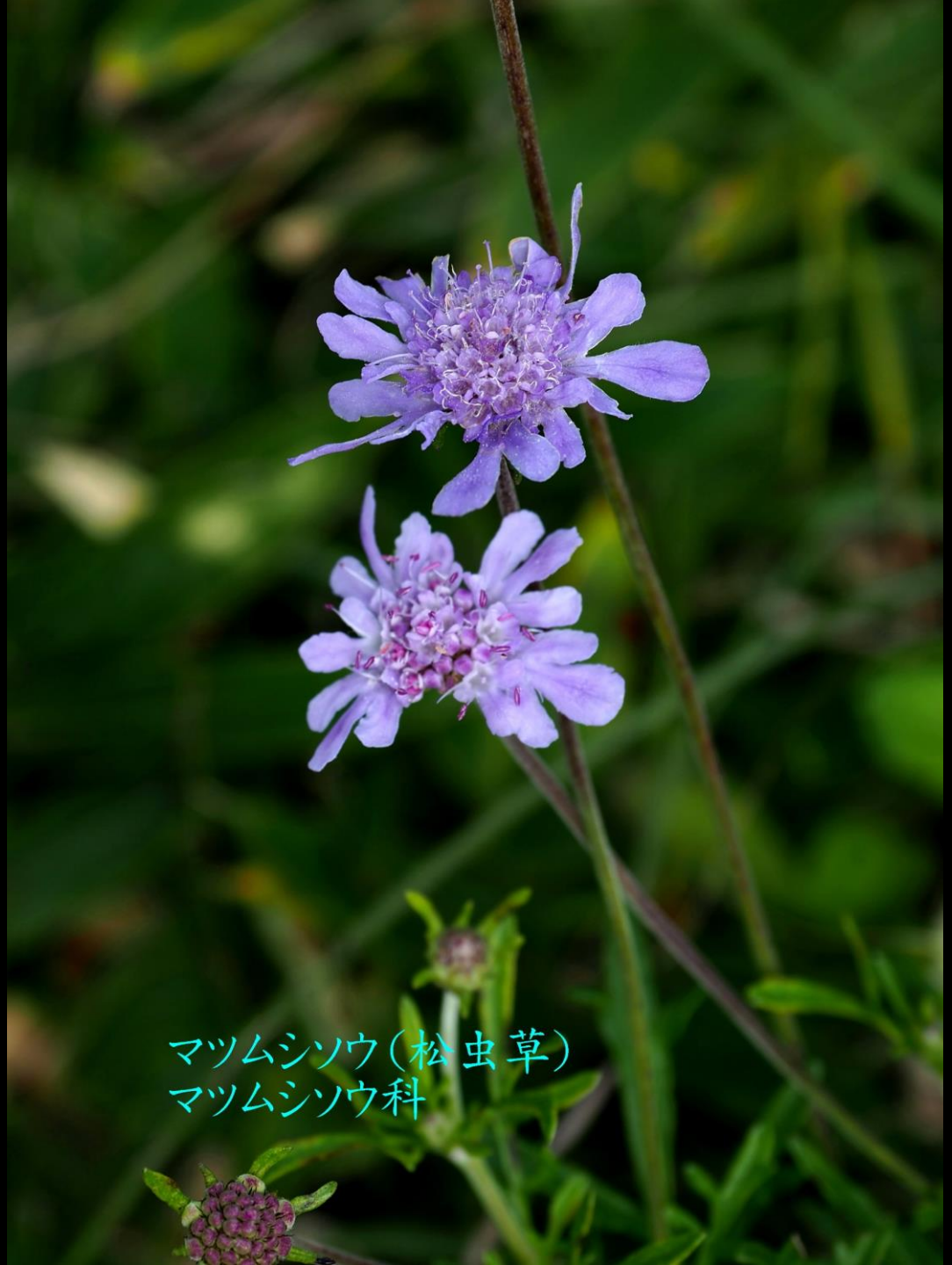
マツムシソウ(松虫草) マツムシソウ科