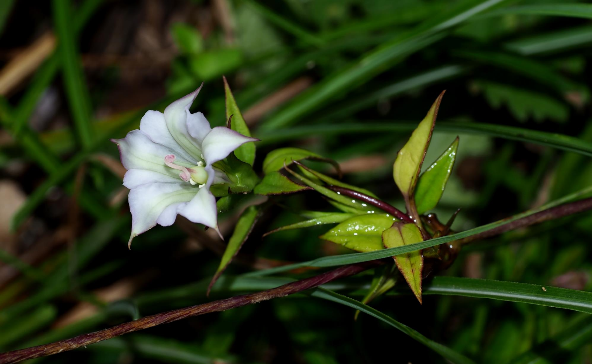
ツルリンドウ(蔓竜胆) リンドウ科