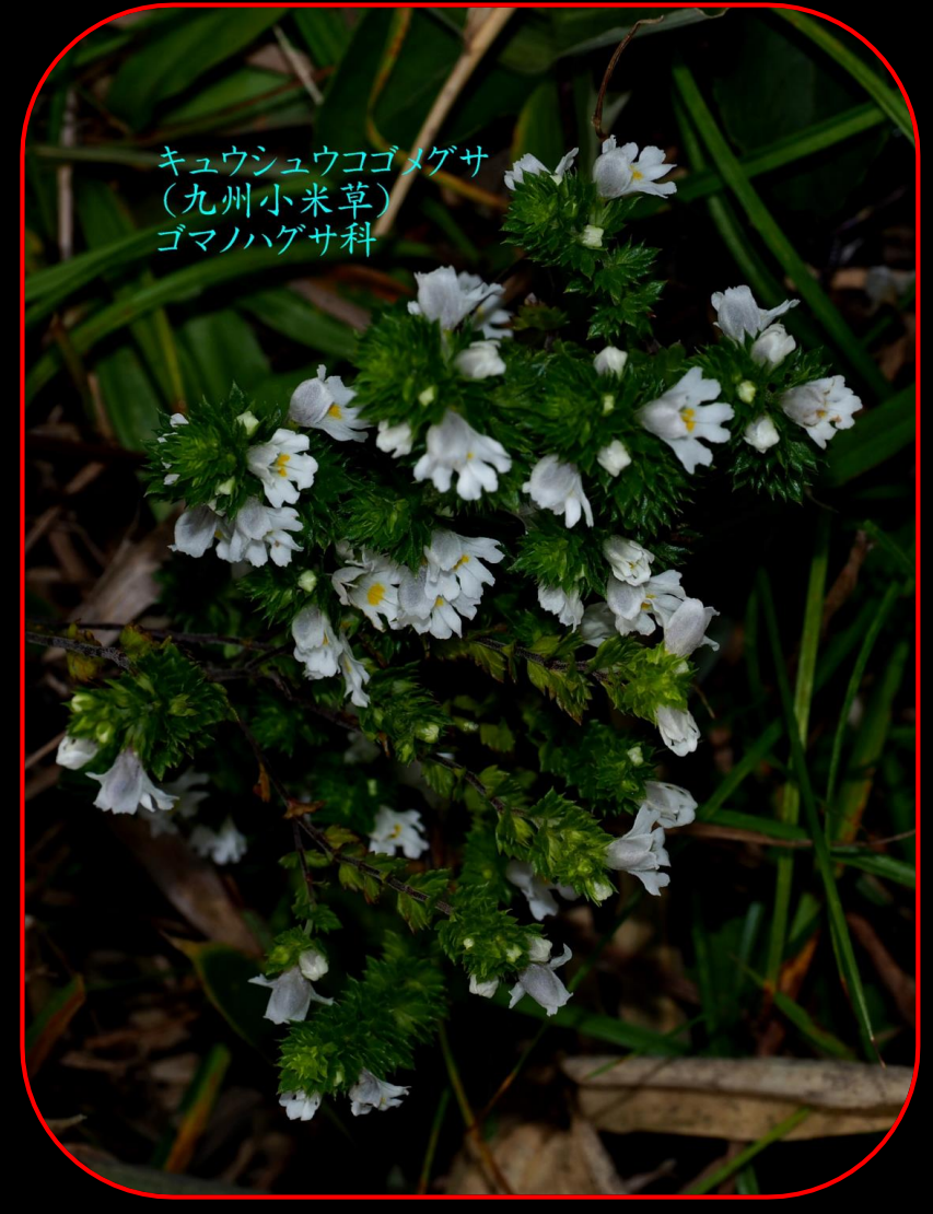
キュウシュウコゴメグサ (九州小米草) ゴマノハグサ科