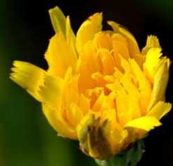
ブタナ(豚菜) キク科 帰化植物