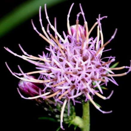
ヒメアザミ(姫薊) キク科