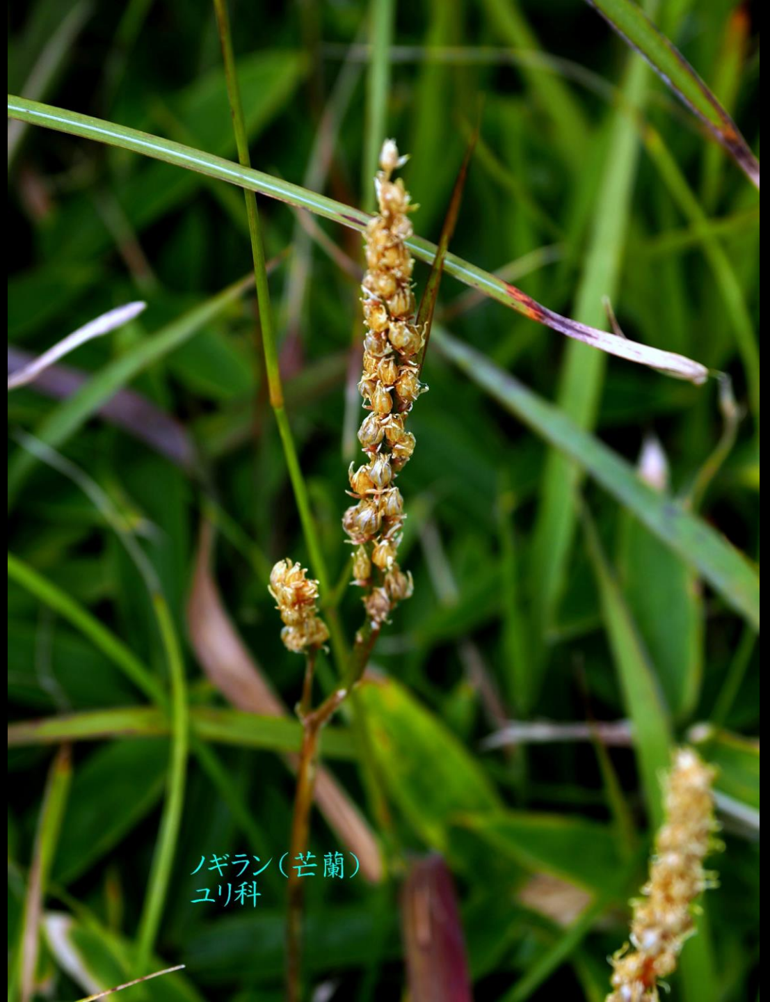
ノギラン(芒蘭) ユリ科