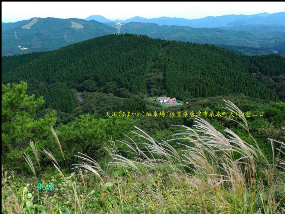
天川(あまかわ)駐車場(佐賀県唐津市厳本町天川)登山口