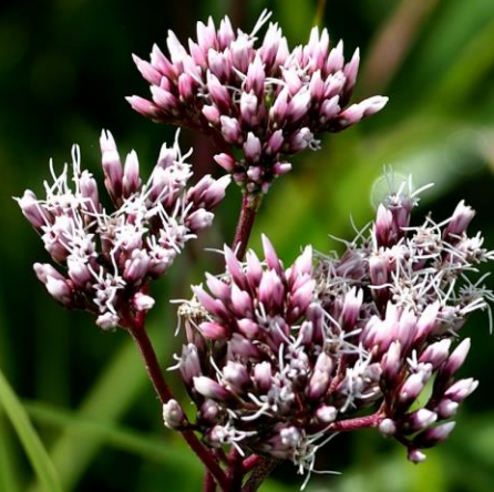
サワヒヨドリ(沢鶉) キク科