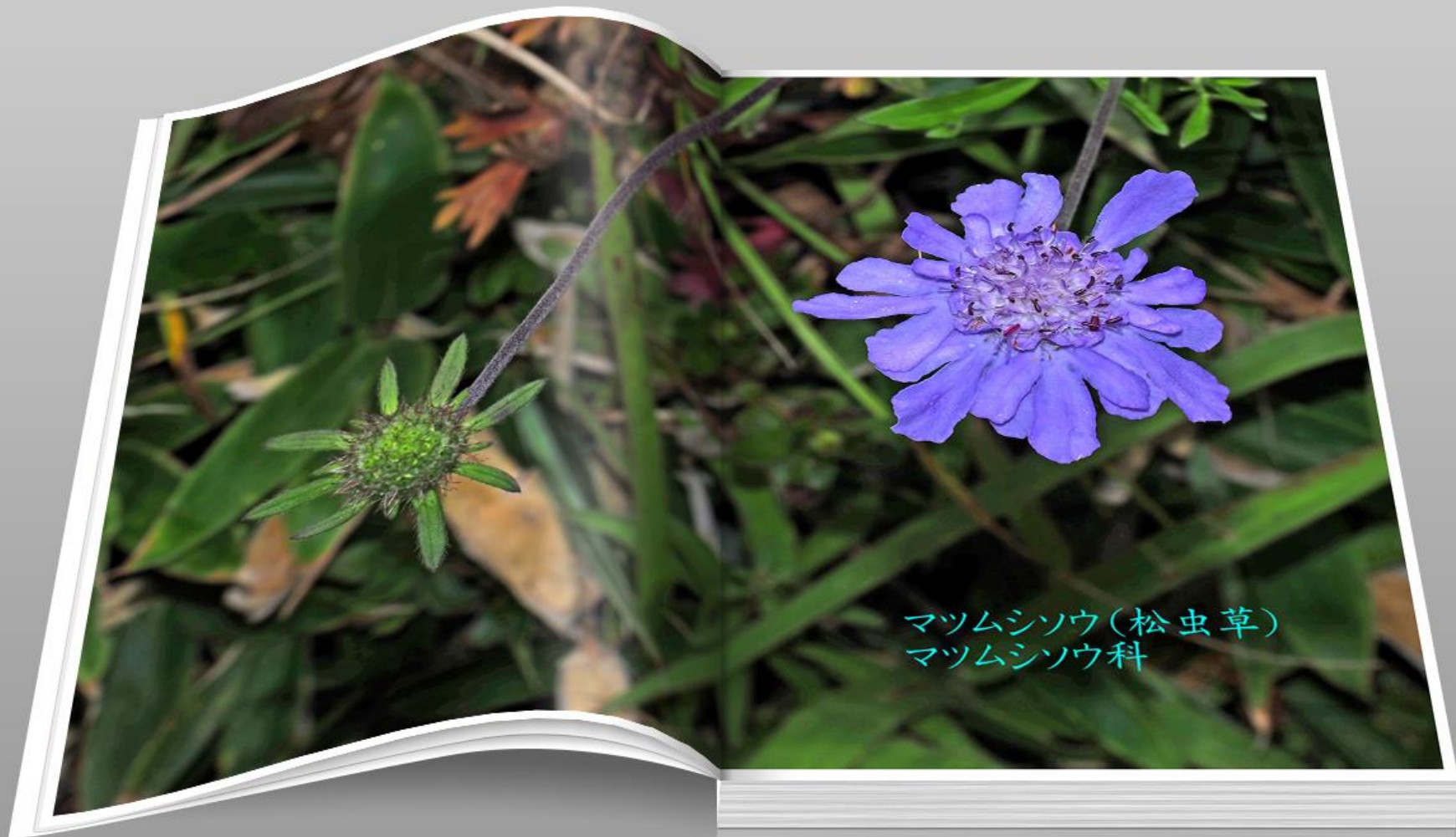
マツムシソウ(松虫草) マツムシソウ科