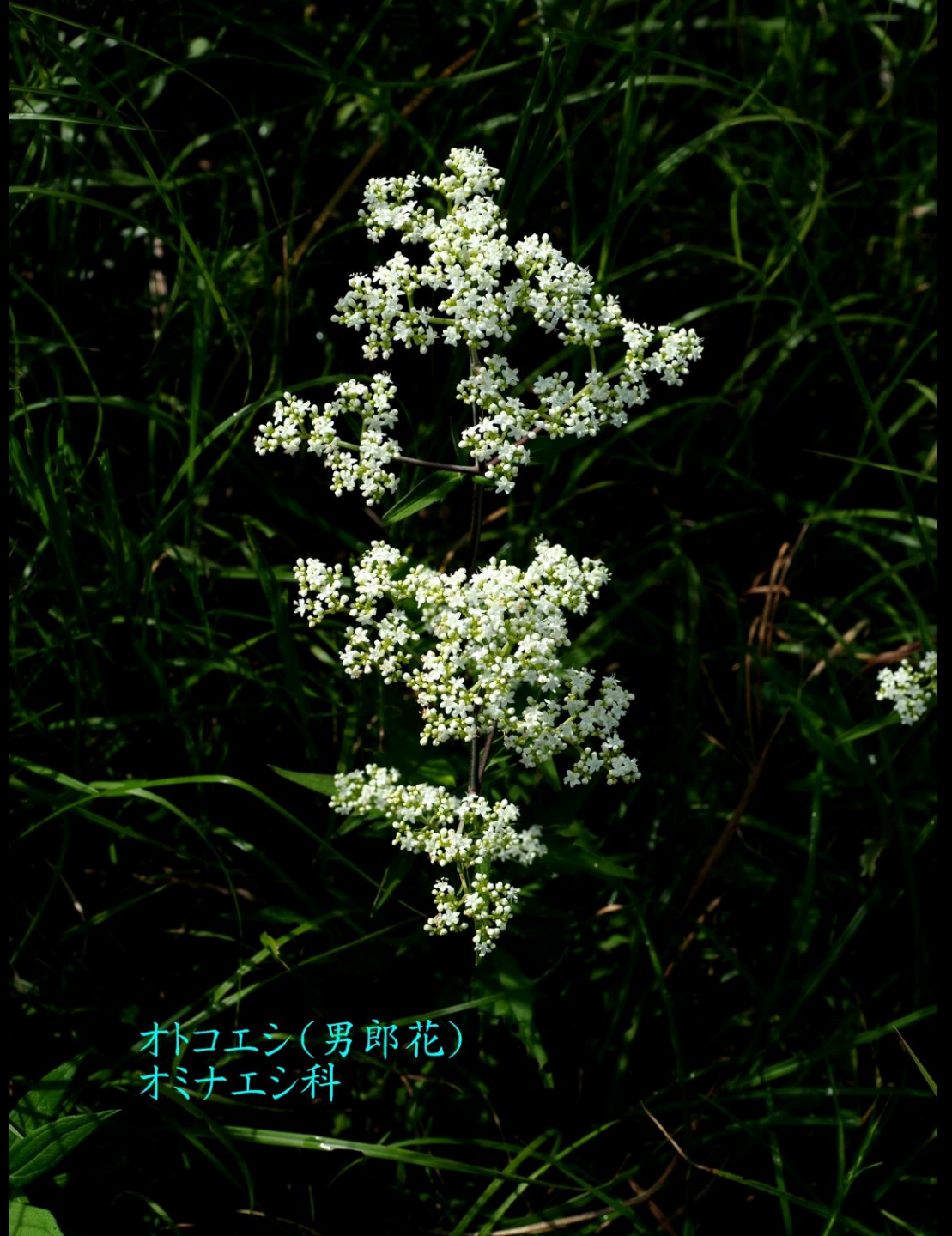
オトコエシ(男郎花) オミナエシ科