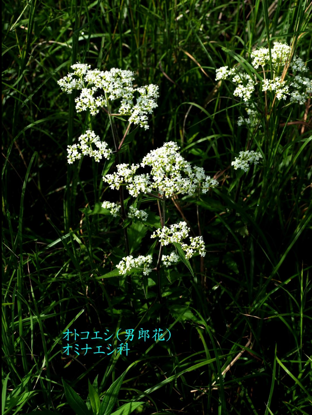
オトコエシ(男郎花) オミナエシ科