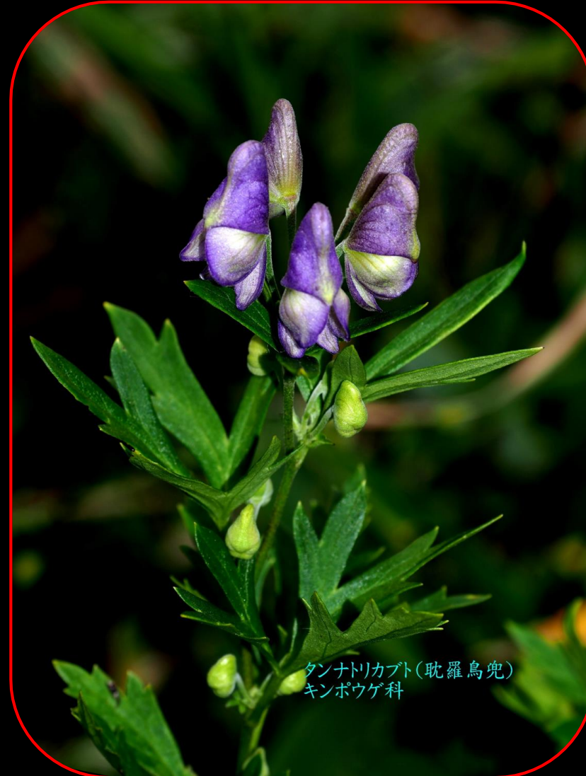
タンナトリカブト(耽羅烏兜) キンポウゲ科