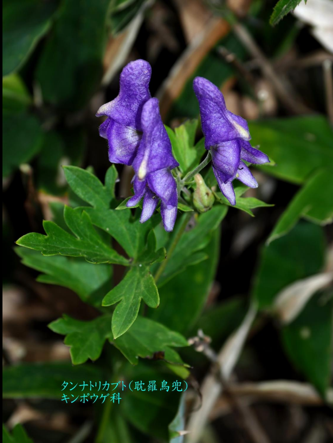
タンナトリカブト(耽羅烏兜) キンポウゲ科