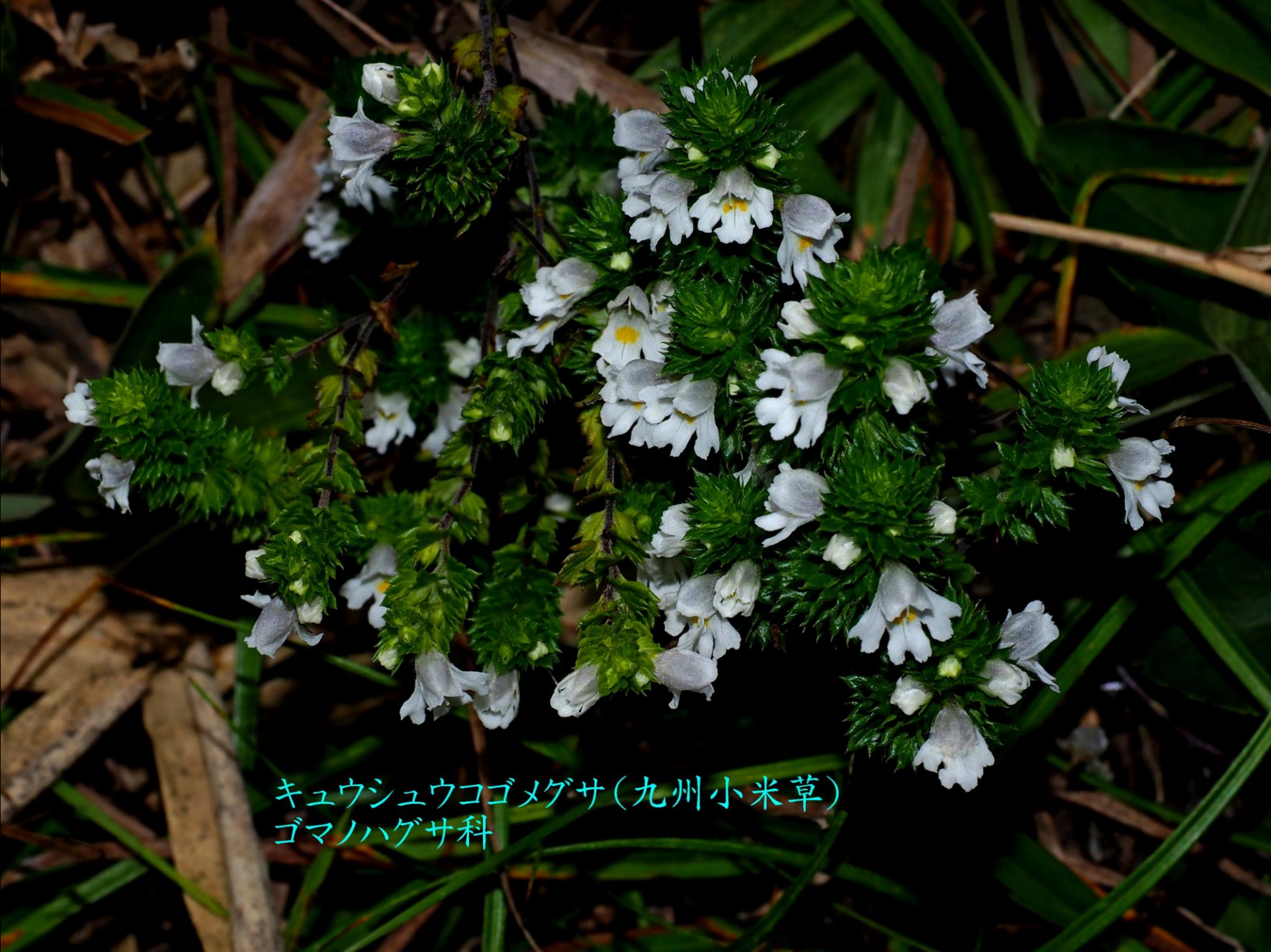
キュウシュウコゴメグサ(九州小米草) ゴマノハグサ科