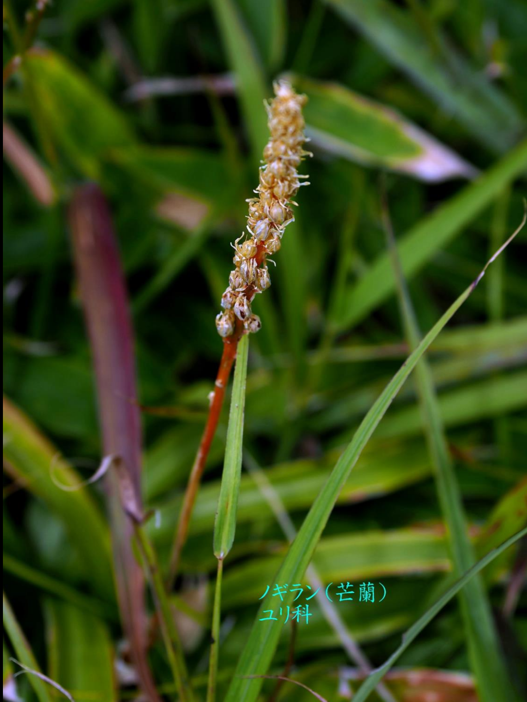
ノギラン(芒蘭) ユリ科