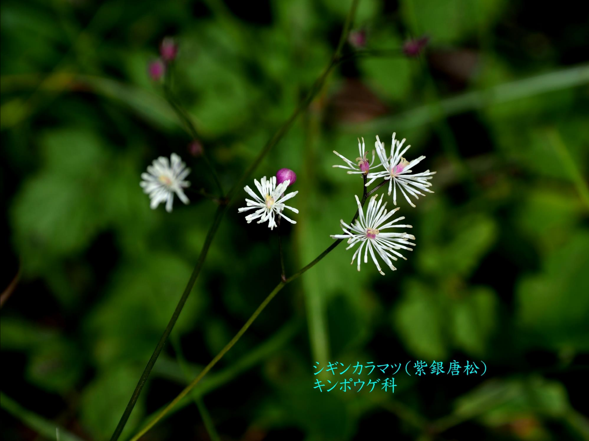
シギンカラマツ(紫銀唐松) キンポウゲ科