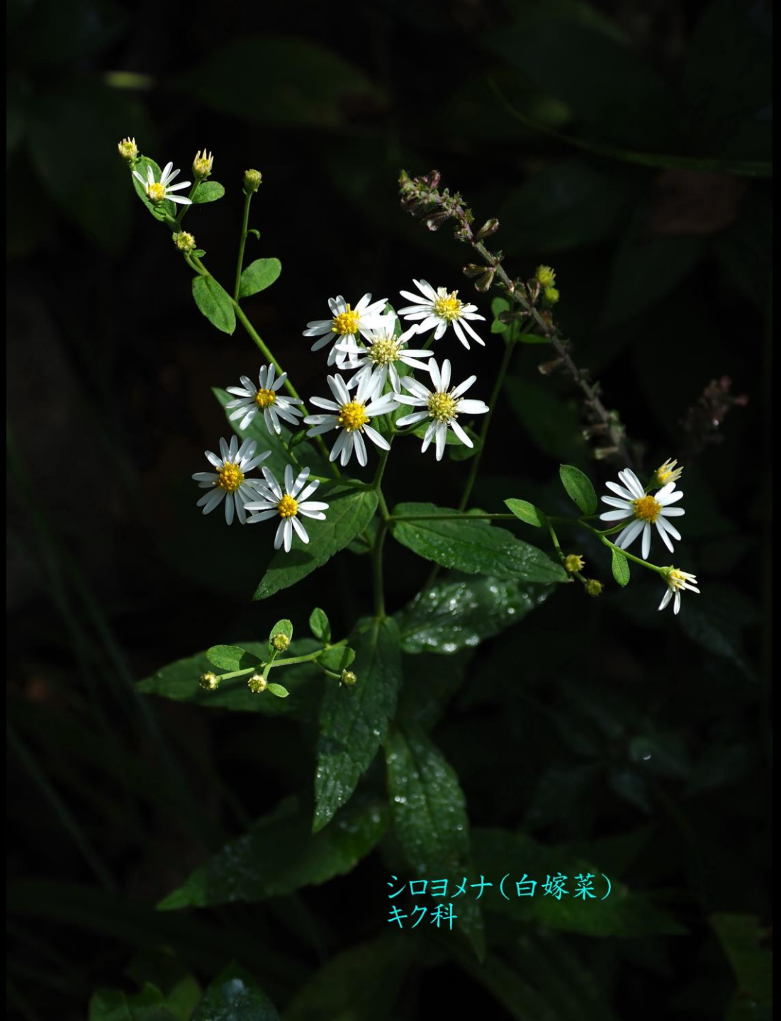
シロヨメナ(白嫁菜) キク科