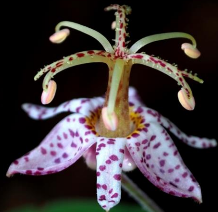
ヤマジノホトギス (山路の杜鵑) ユリ科