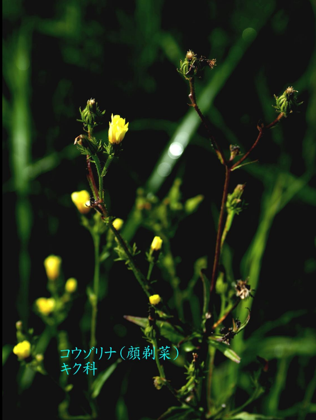
コウゾリナ(顔剃菜) キク科