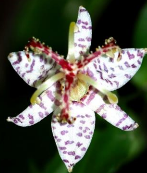
ヤマジノホトギス(山路の杜鵑) ユリ科