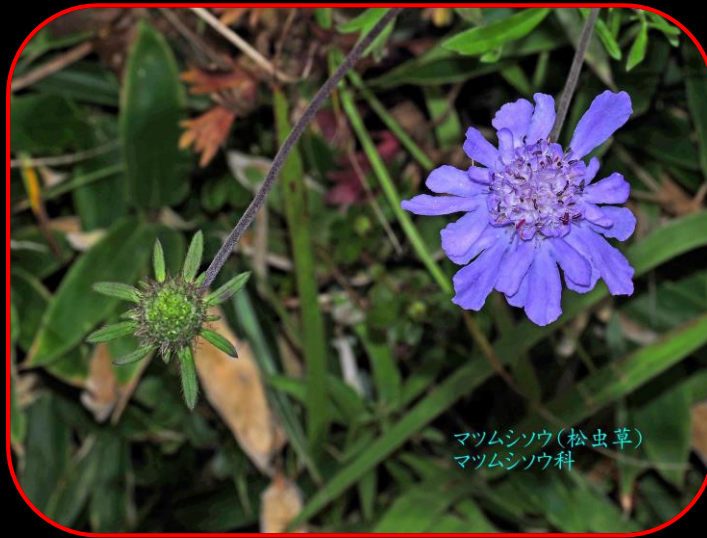
マツムシソウ(松虫草) マツムシソウ科