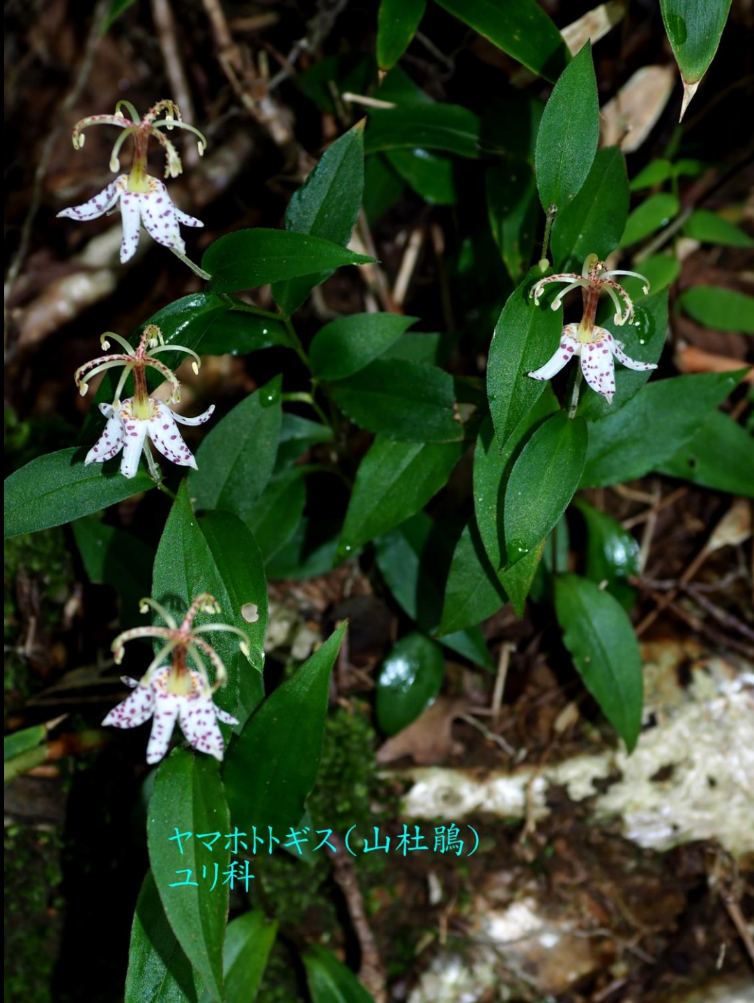
ヤマホトギス(山杜鵑) ユリ科