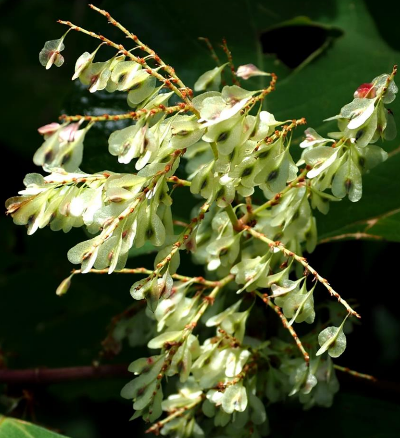
イタドリ(虎杖、痛取) タデ科 別名;スカンポ、イタンポ、ドンゲイ