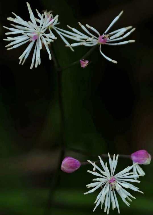
シギンカラマツ(紫銀唐松) キンポウゲ科