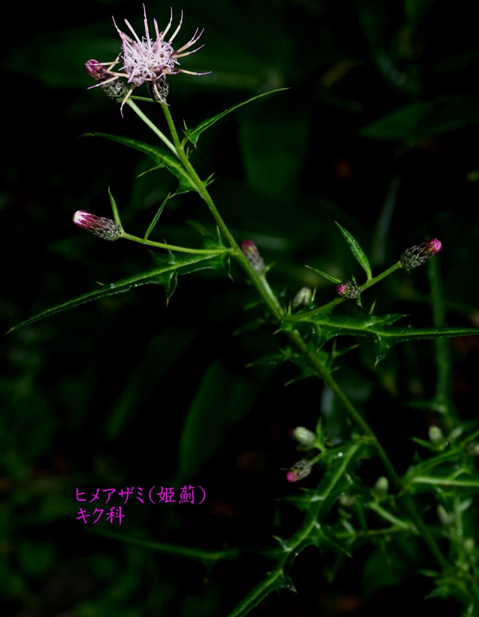
ヒメアザミ(姫薊) キク科