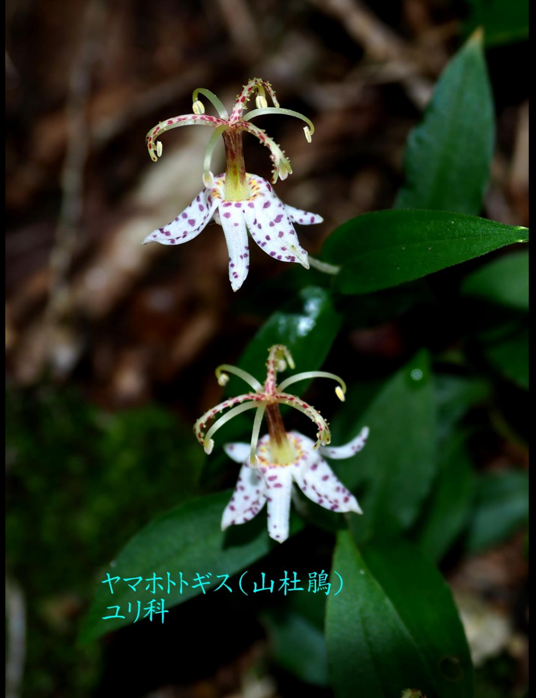
ヤマホトギス(山杜鵑) ユリ科