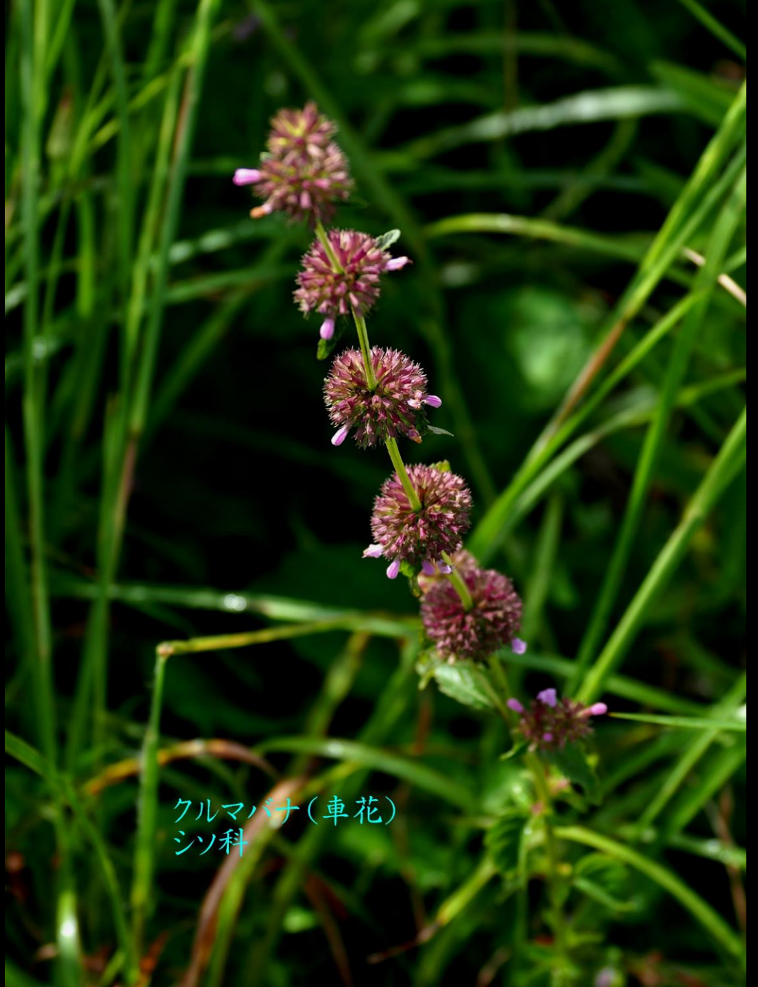
クルマバナ(車花) シソ科