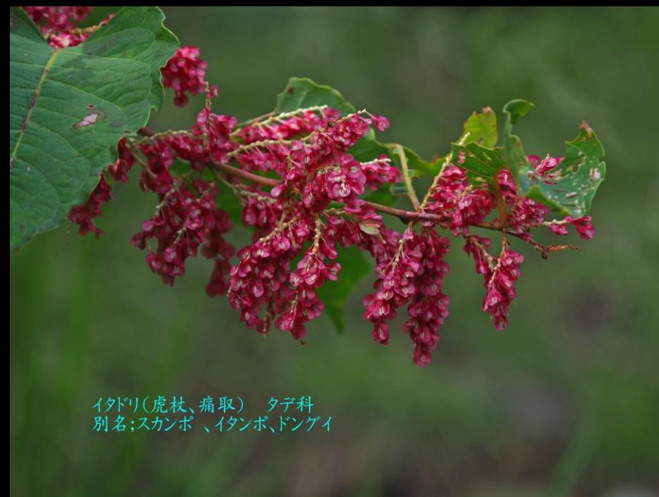
イタドリ(虎杖、痛取) タデ科 別名;スカンポ、イタンポ、ドンゲイ