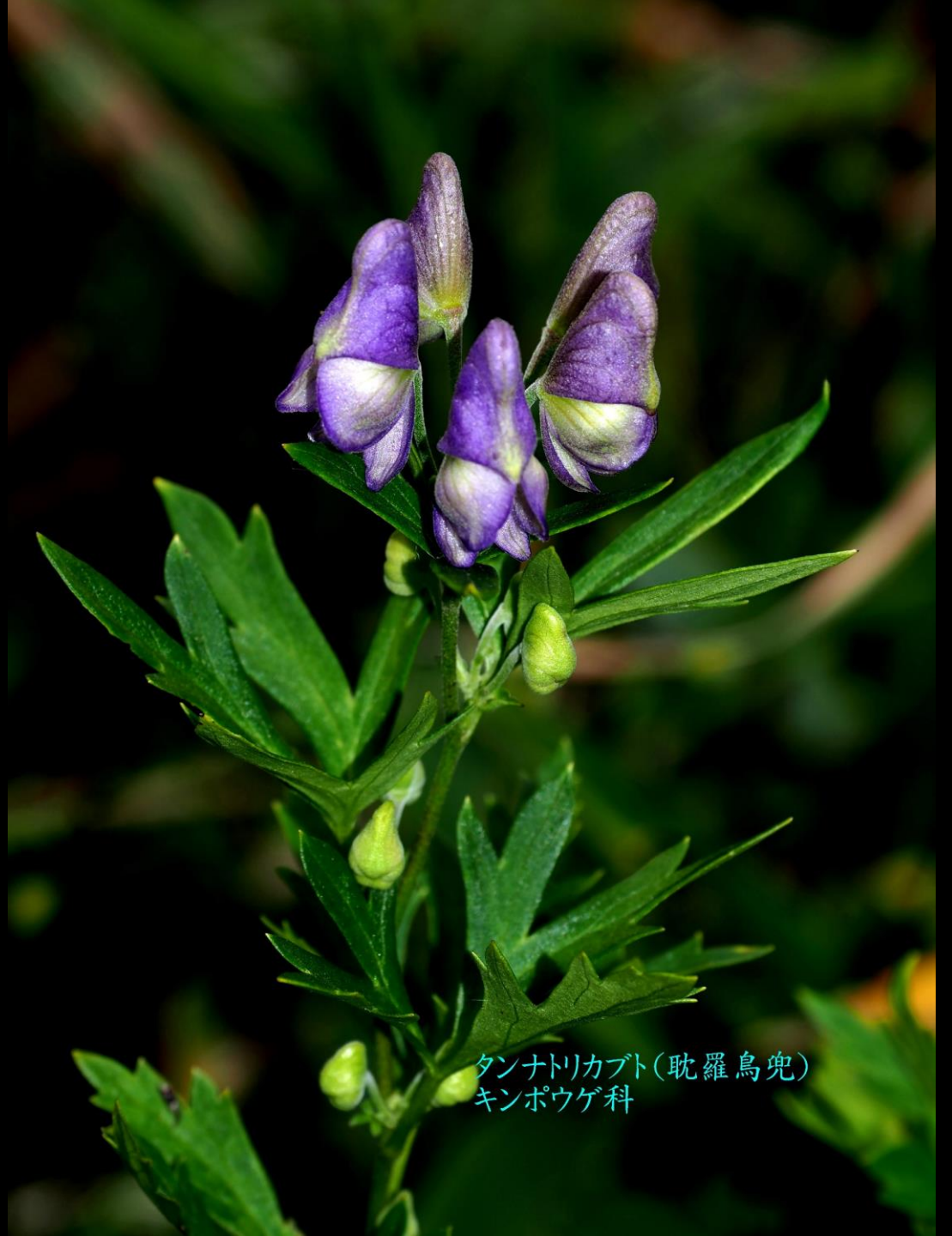
タンナトリカブト(耽羅烏兜) キンポウゲ科