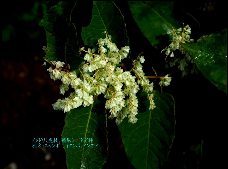
イタドリ(虎杖、痛取) タデ科 別名:スカンボ、イタンボ、ドンガイ