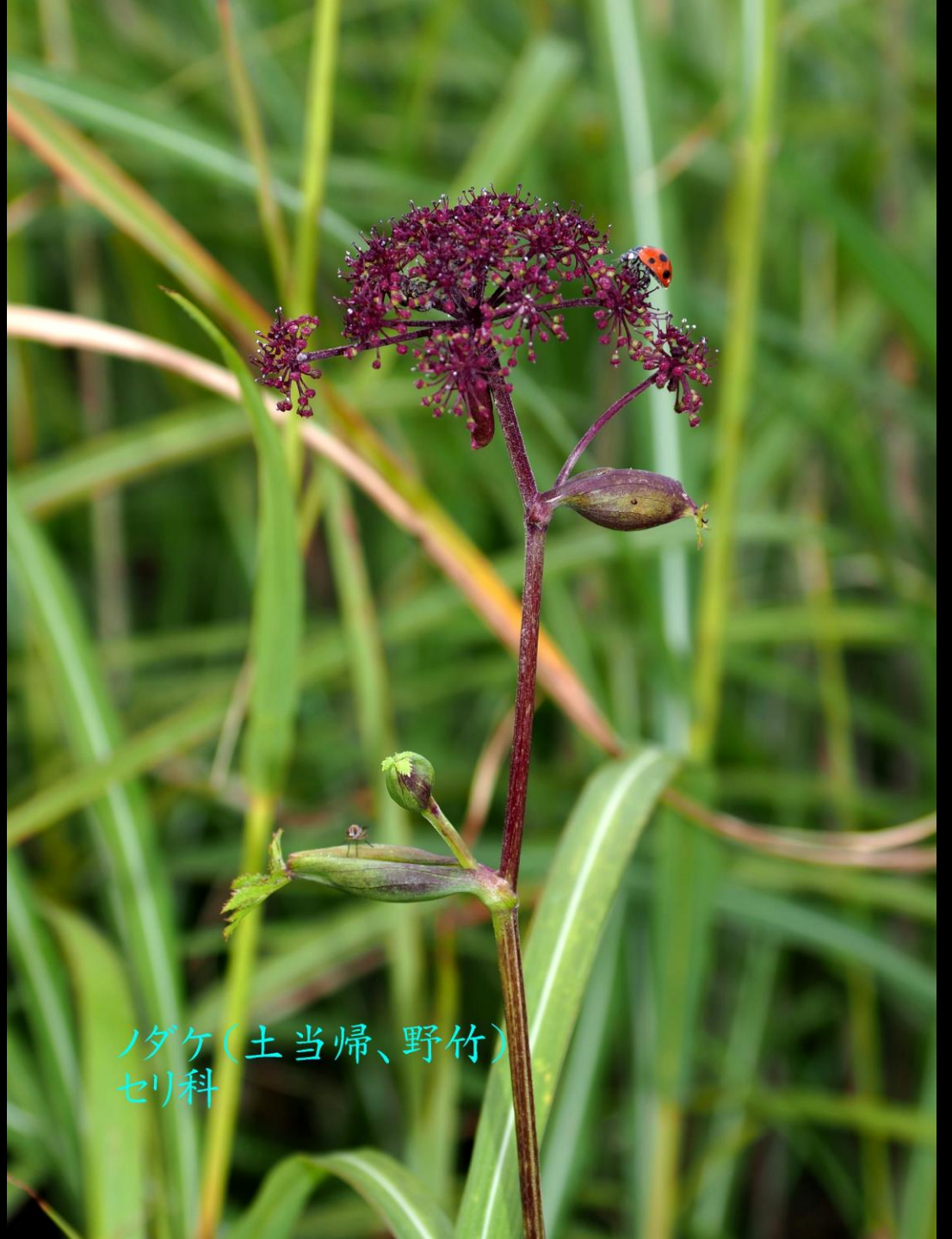
ノダケ(土当归、野竹) セリ科