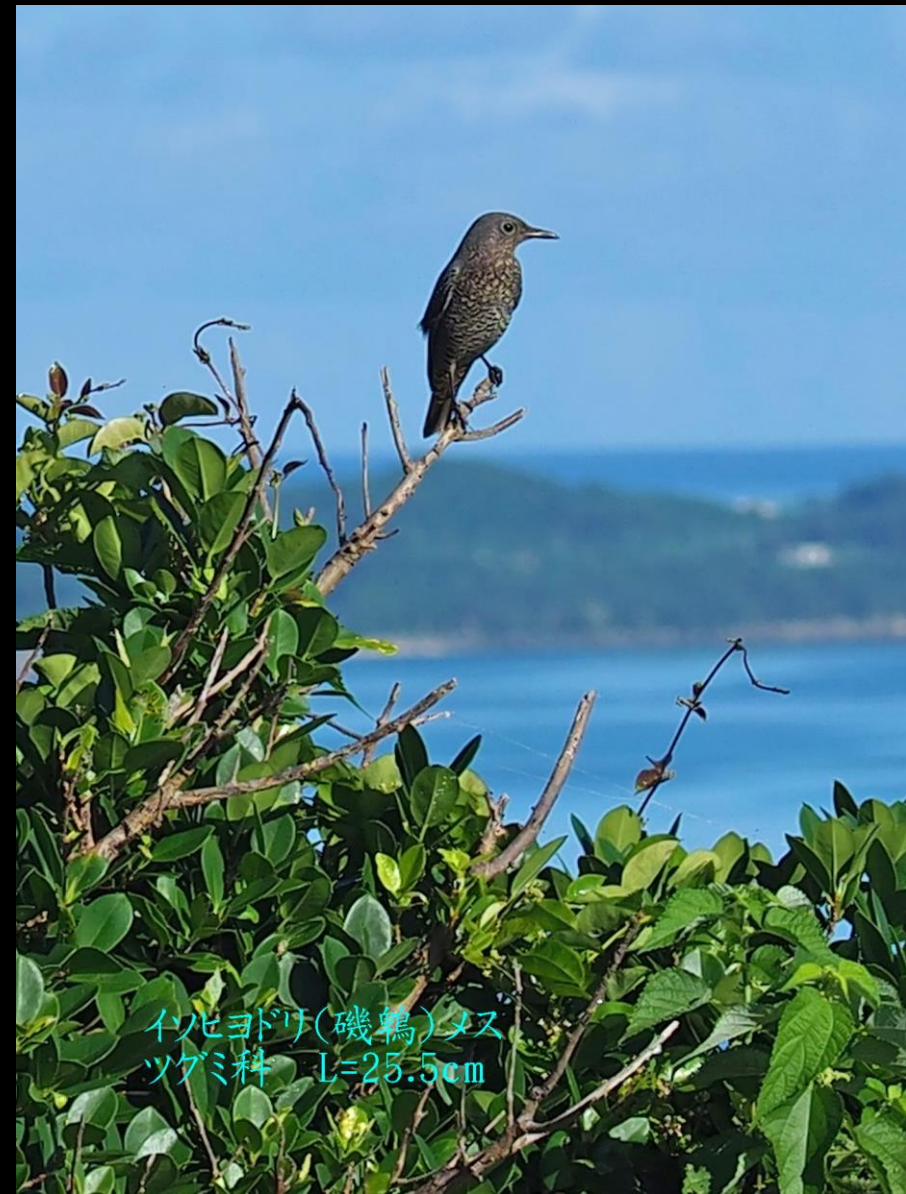
イノヒヨドリ(磯鴉)メス ツグミ科 L=25.5cm