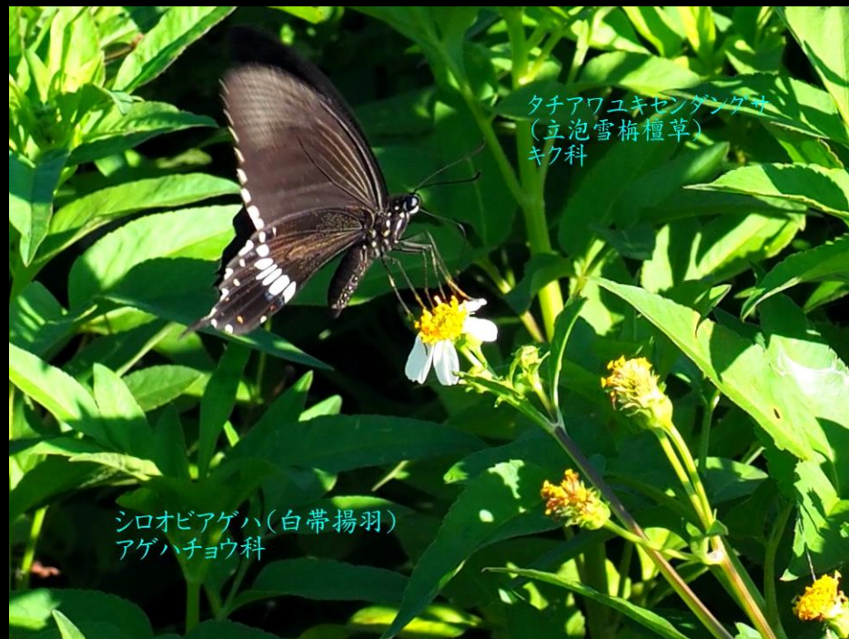
タチアワユキセンダングサ (立泡雪梅檀草) キク科