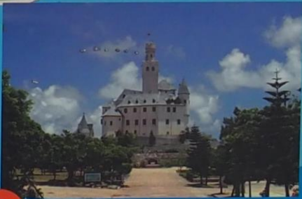
4 うえのドイツ文化村