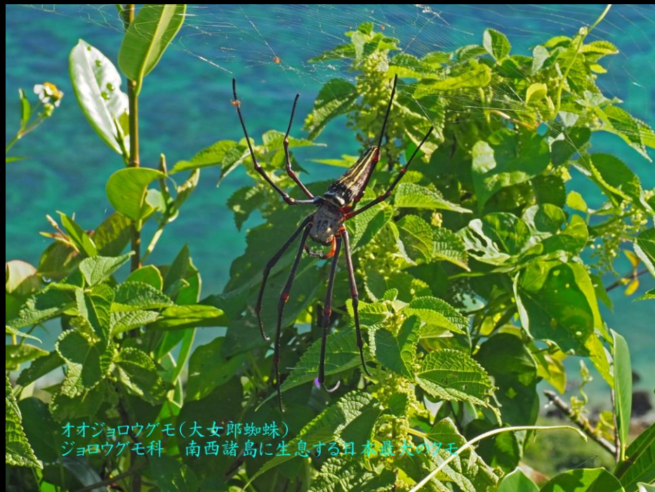
オオジョロウグモ(大女郎蜘蛛) ジョロウグモ科 南西諸島に生息する日本最大の蜘蛛