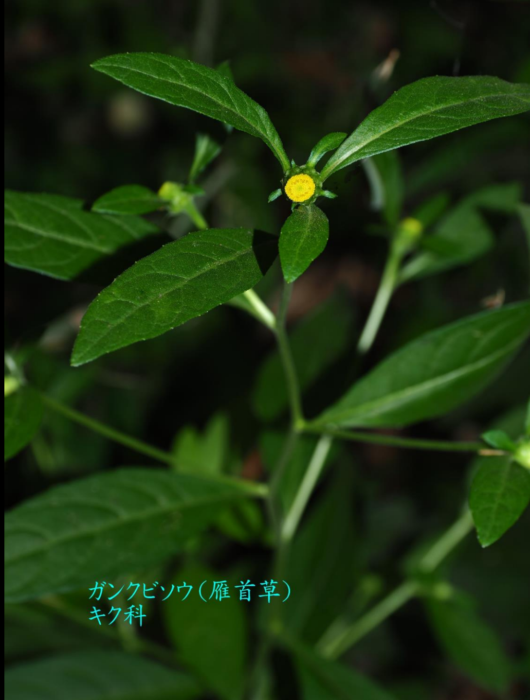
ガンクビソウ(雁首草) キク科