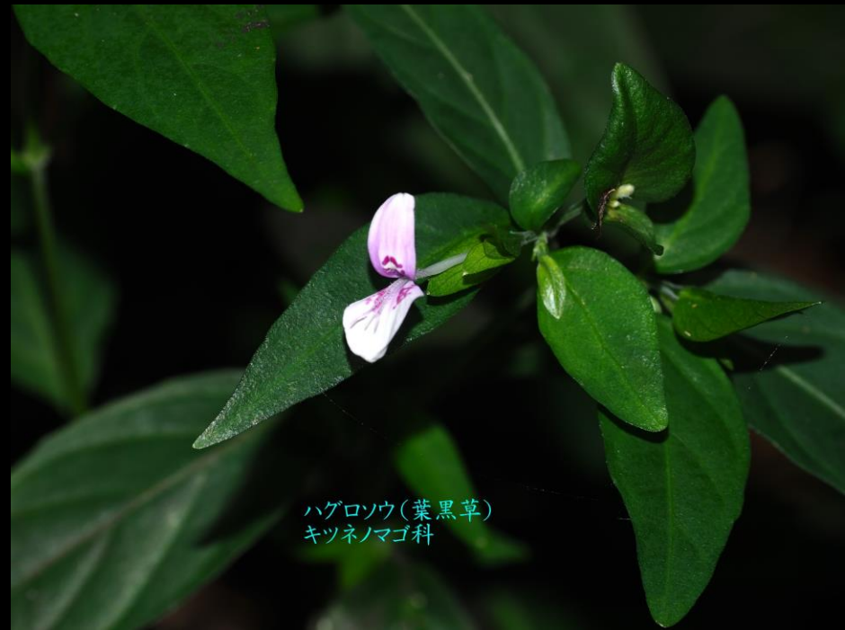
ハグロソウ(葉黒草) キツネノマゴ科