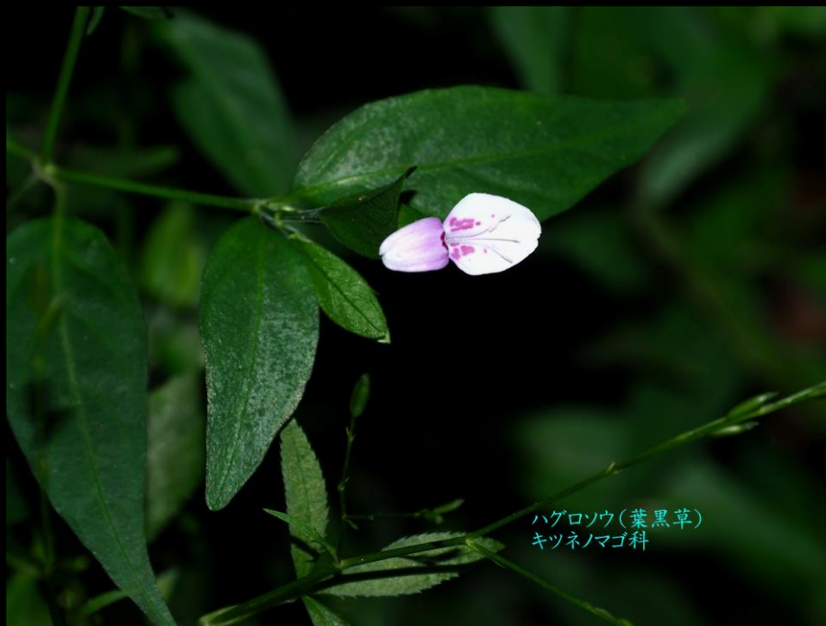
ハグロソウ(葉黒草) キツネノマゴ科