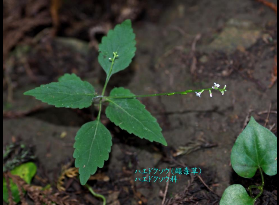
ハエドクソウ(蠅毒草) ハエドクソウ科