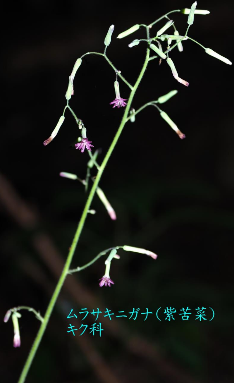
ムラサキニガナ(紫苦菜) キク科