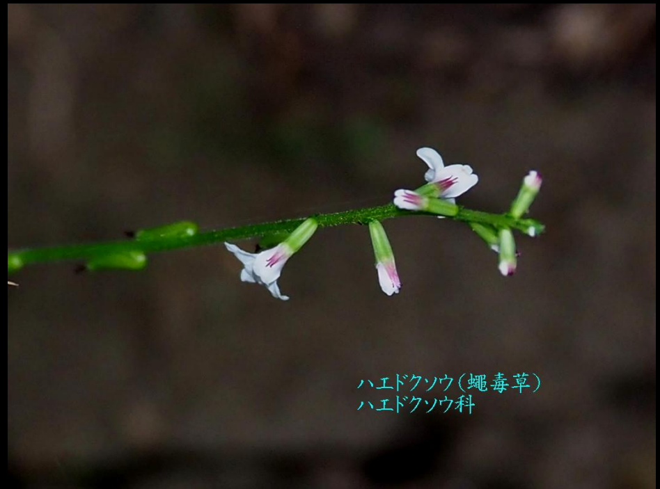
ハエドクソウ(蠅毒草) ハエドクソウ科