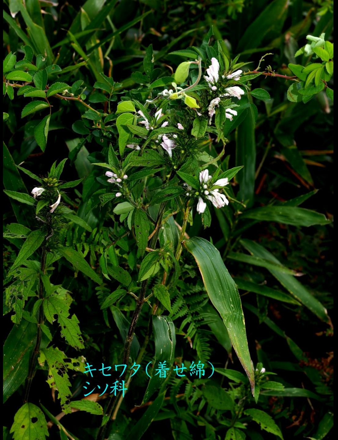
キセワタ(着せ綿) シソ科