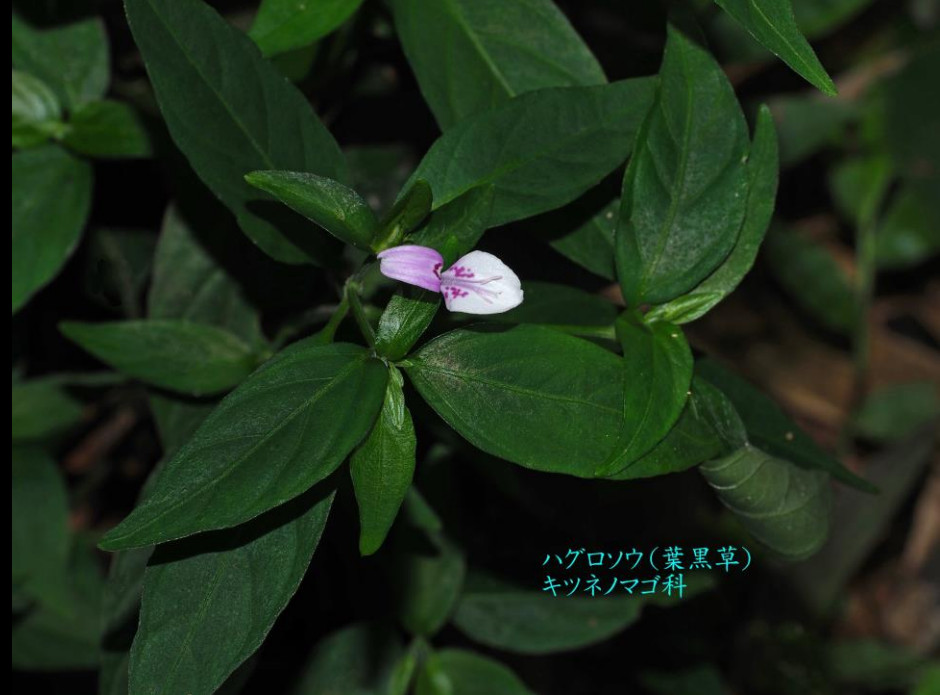
ハグロソウ(葉黒草) キツネノマゴ科