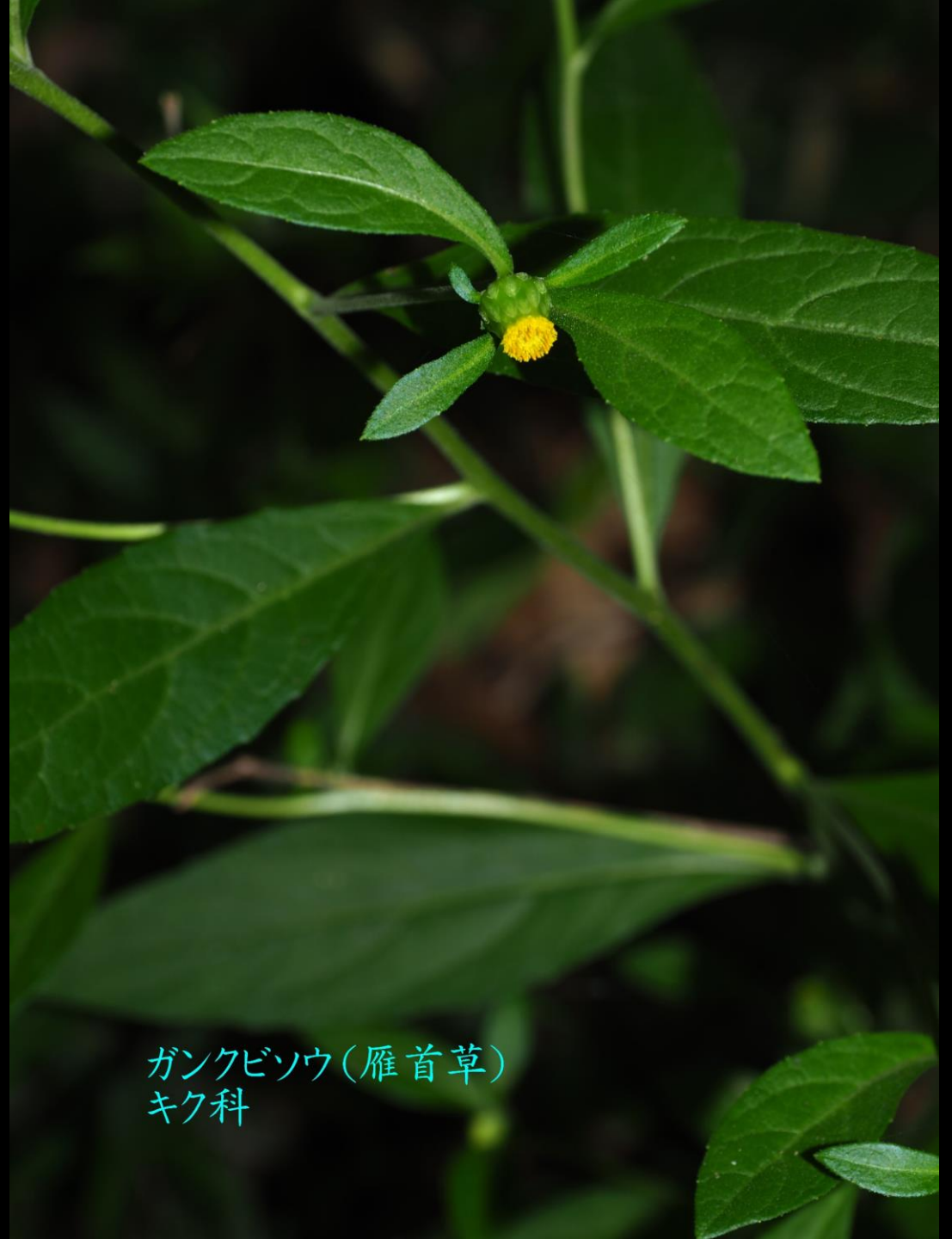
ガンクビソウ(雁首草) キク科