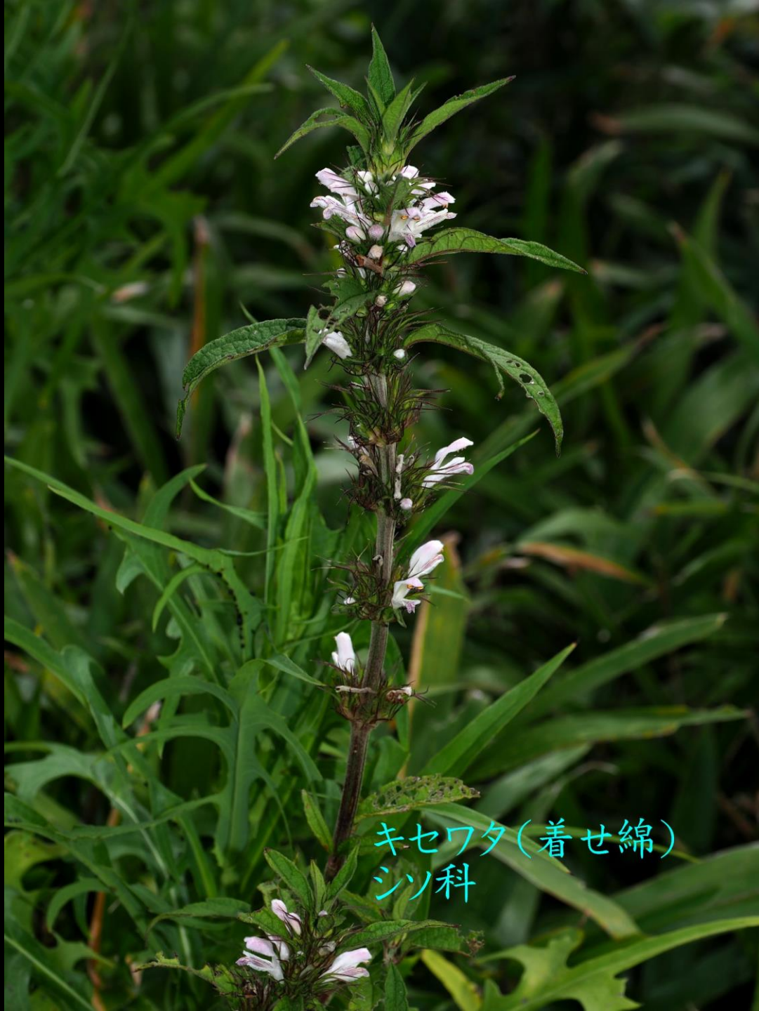
キセワタ(着せ綿) シソ科