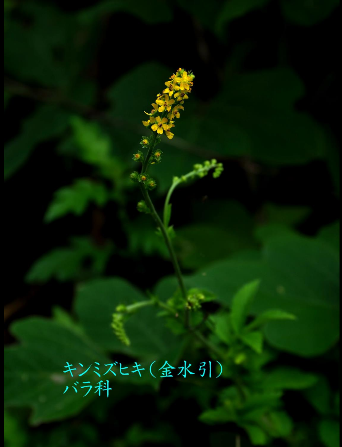
キンミズヒキ(金水引) バラ科