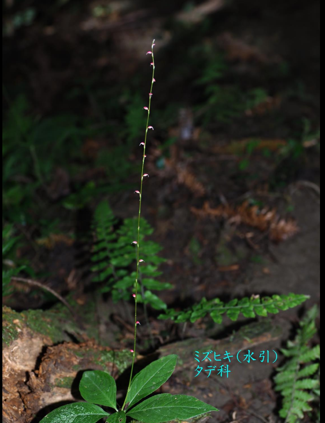
ミズヒキ(水引) タデ科