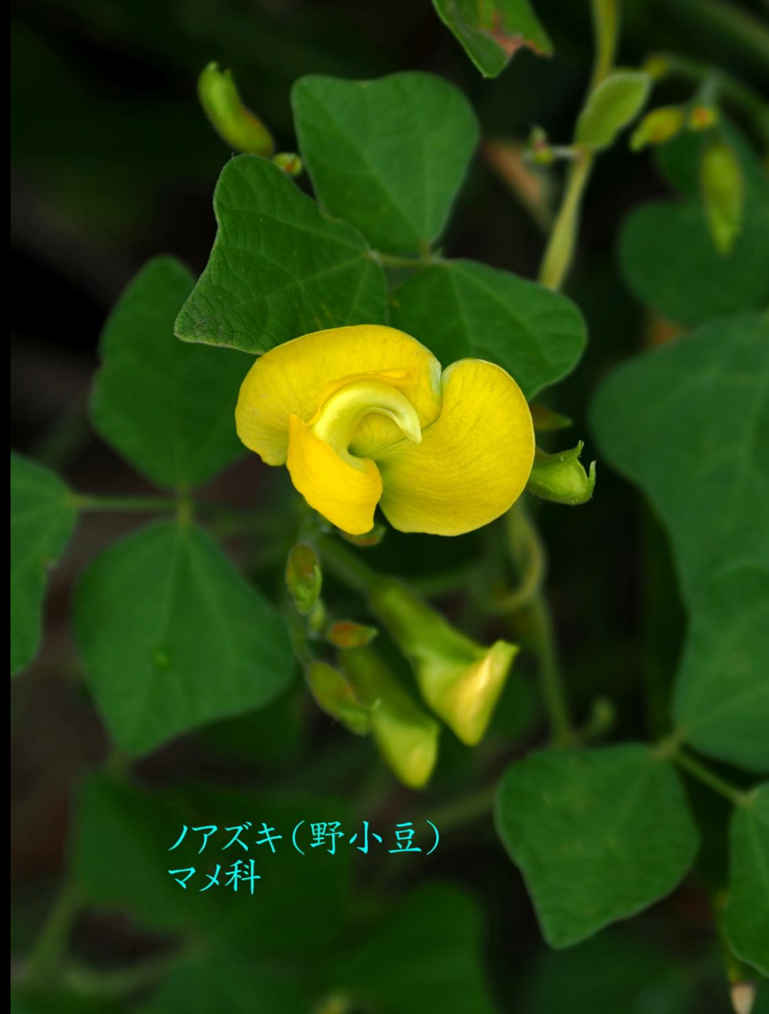
ノアズキ(野小豆) マメ科