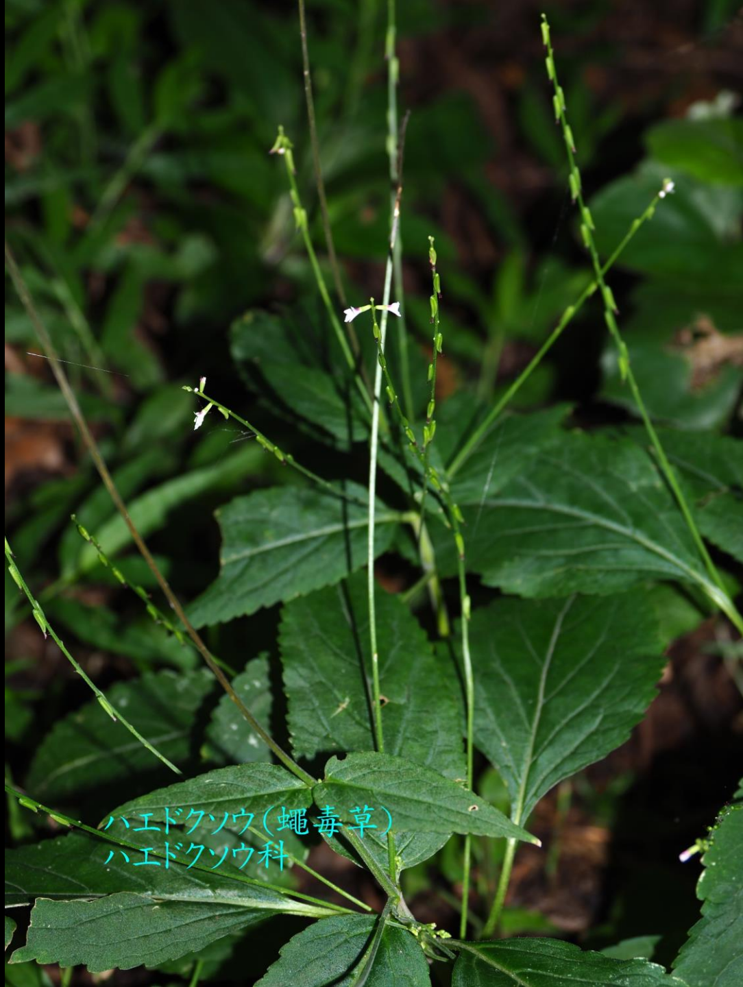
ハエドクソウ(蠅毒草) ハエドクソウ科