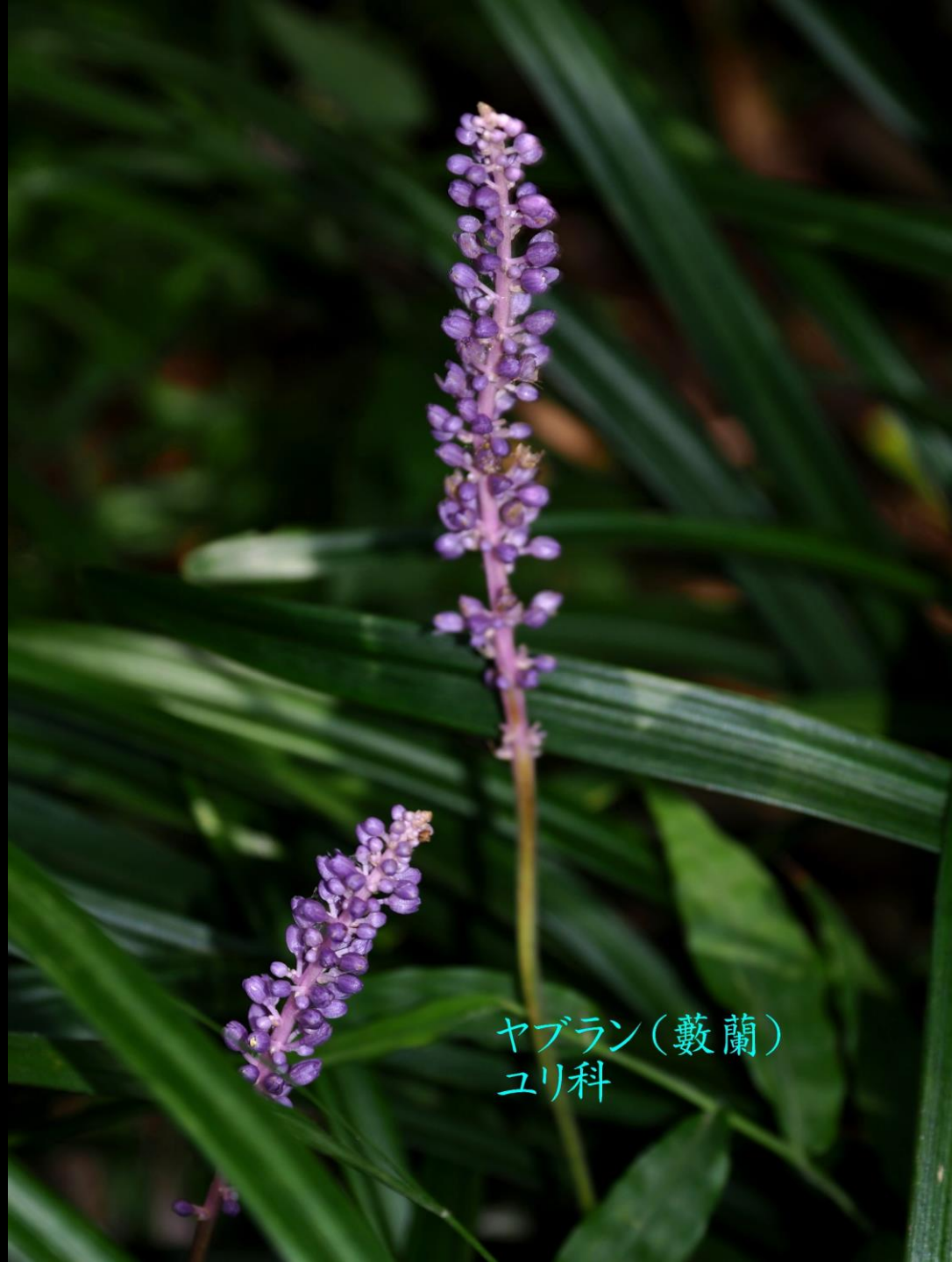
ヤブラン(藪蘭) ユリ科