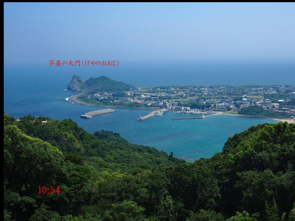
茶屋の大門(けやのおおと)