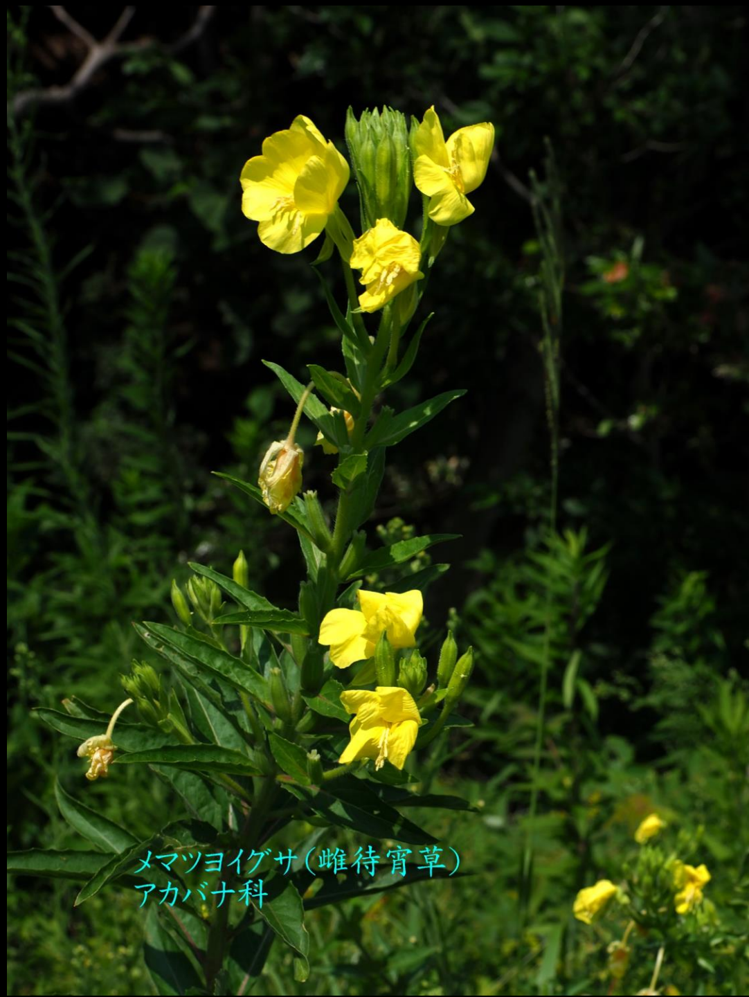
メマツヨイグサ(雌待宵草) アカバナ科