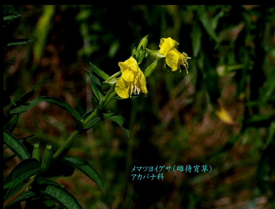
メマツヨイグサ(雌待宵草) アカバナ科