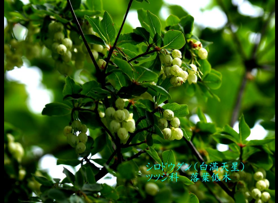
シロドウダン(白満天星) ツツジ科 落葉低木