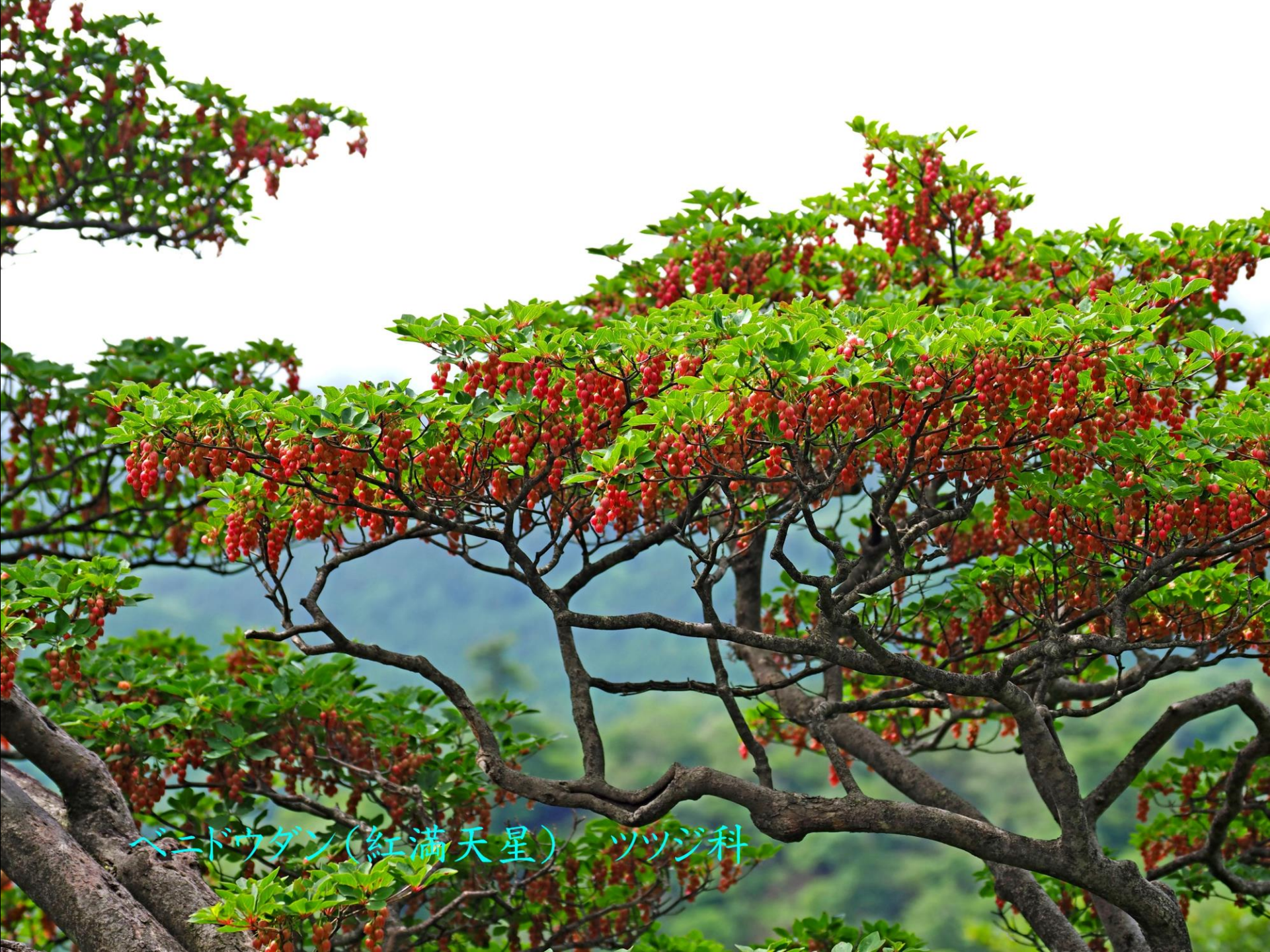
ベニドウダン(紅満天星) ツツジ科