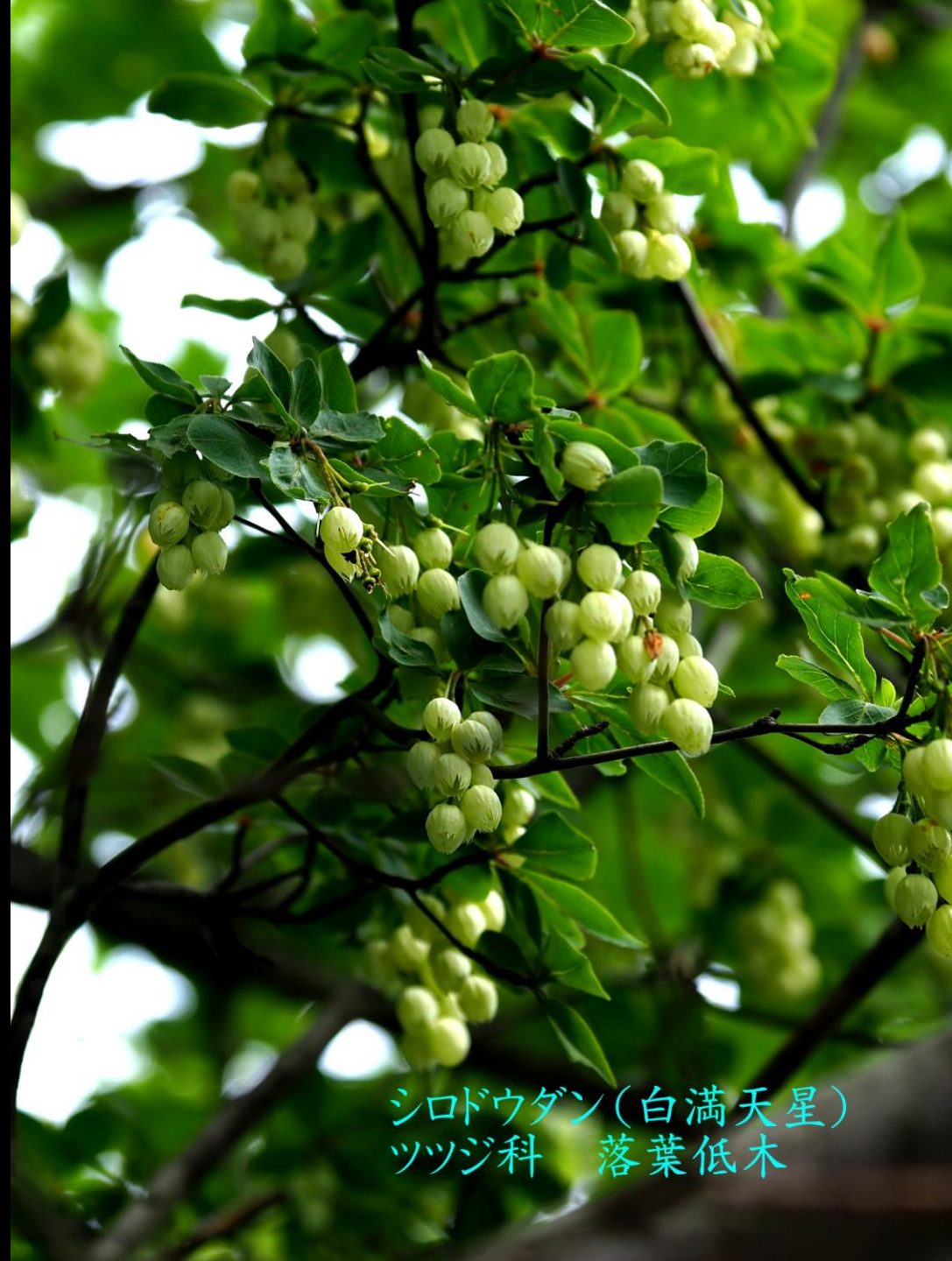
シロドウダン(白満天星) ツツジ科 落葉低木