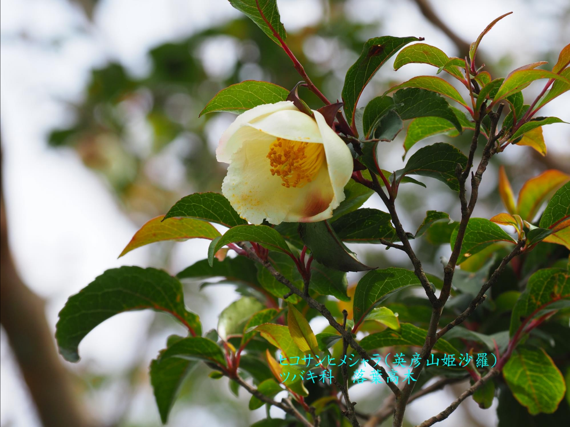
ヒコサンヒメジャラ(英彦山姫沙羅) ツバキ科 落葉高木