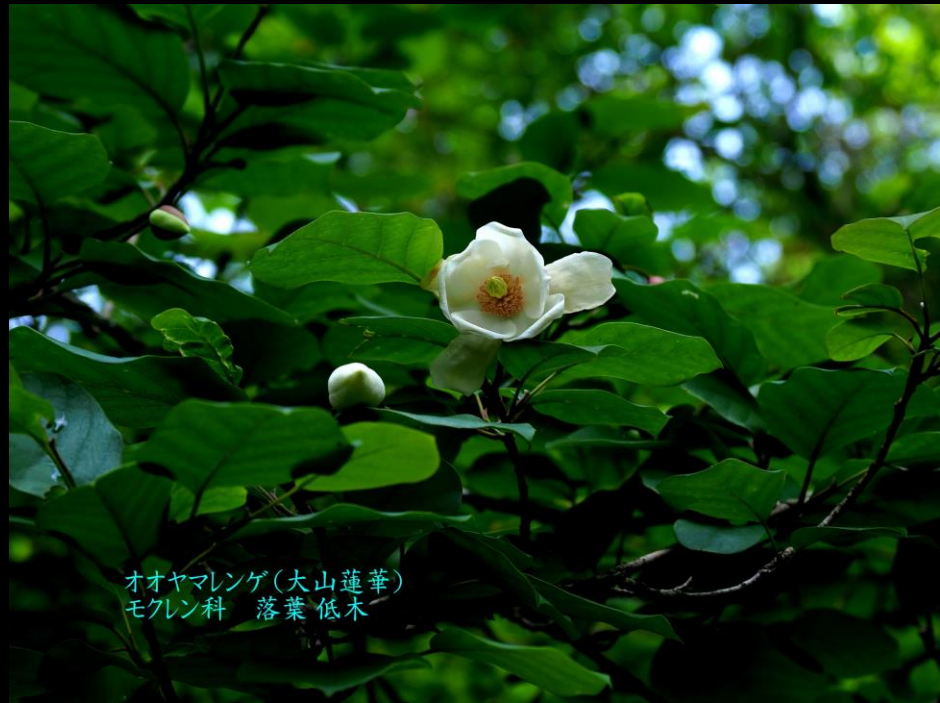
オオヤマレンゲ(大山蓮華) モクレン科 落葉低木