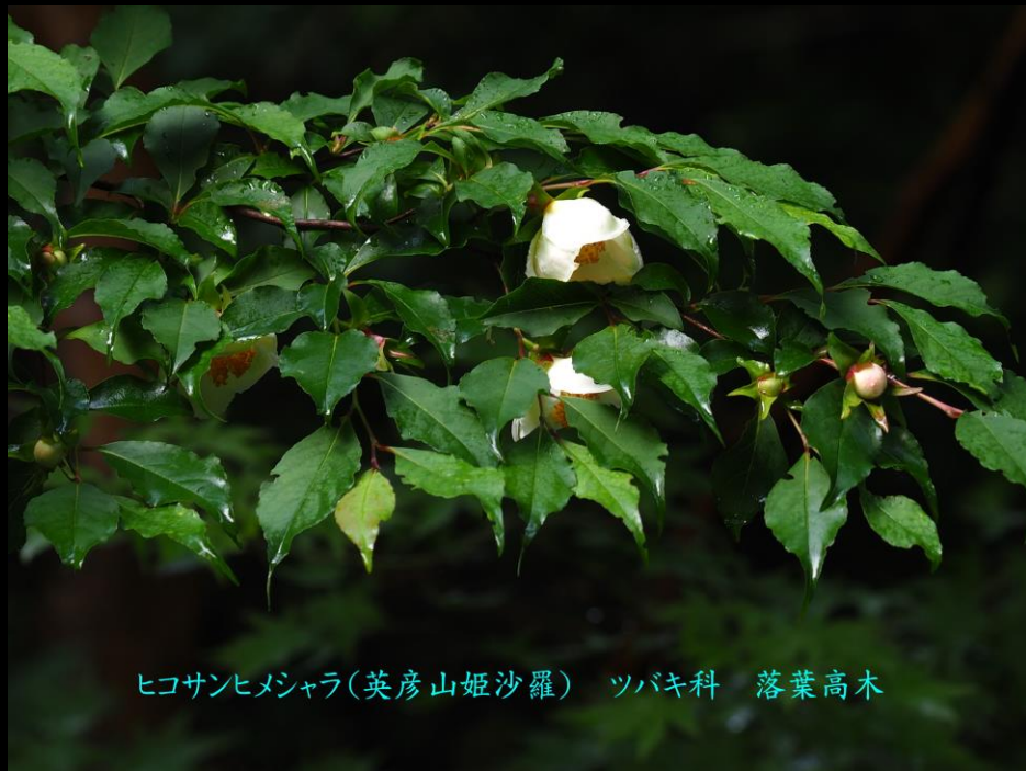
ヒコサンヒメジャラ(英彦山姫沙羅) ツバキ科 落葉高木