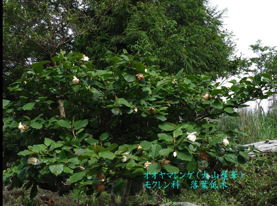
オオヤマレンゲ(大山蓮華) モクレン科 落葉低木