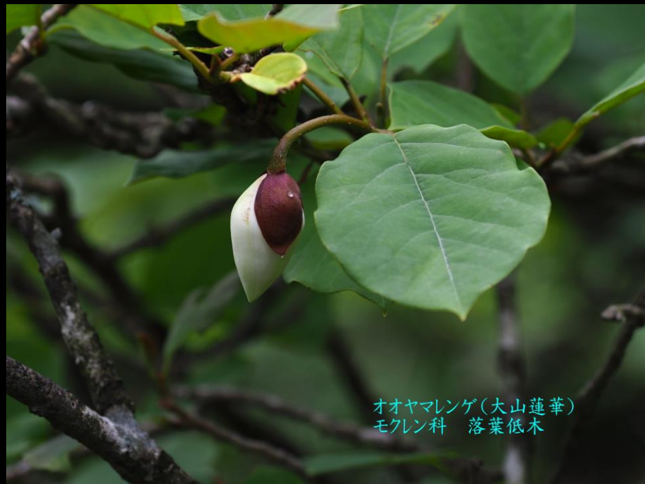
オオヤマレンゲ(大山蓮華) モクレン科 落葉低木