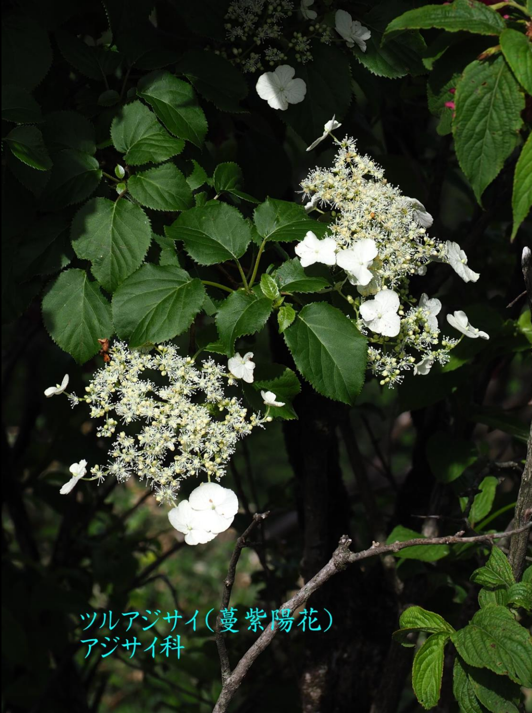
ツルアジサイ(蔓紫陽花) アジサイ科