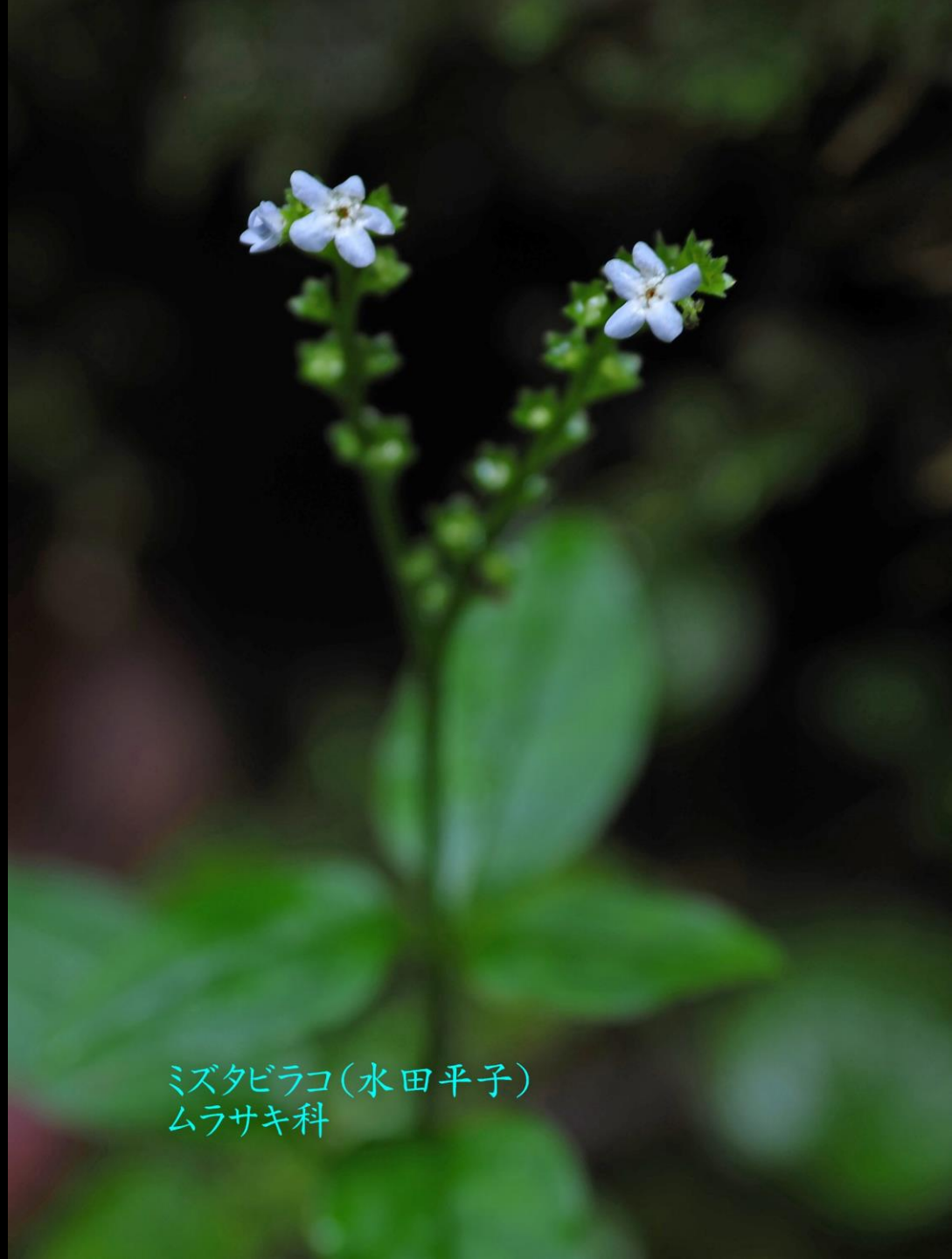
ミズタビラコ(水田平子) ムラサキ科