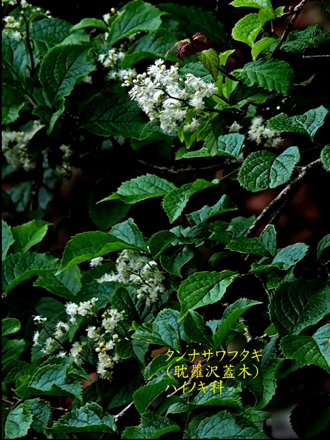
タンナサワフタギ (耽羅沢蓋木) ハイノキ科