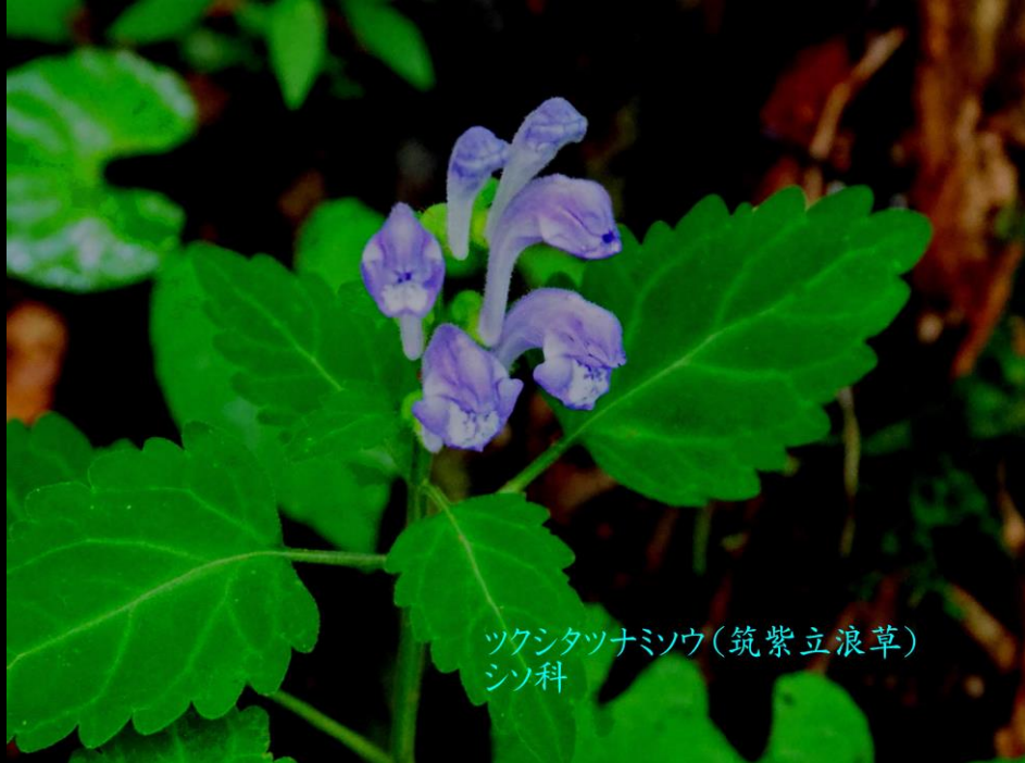
ツクシタツナミソウ(筑紫立浪草) シソ科