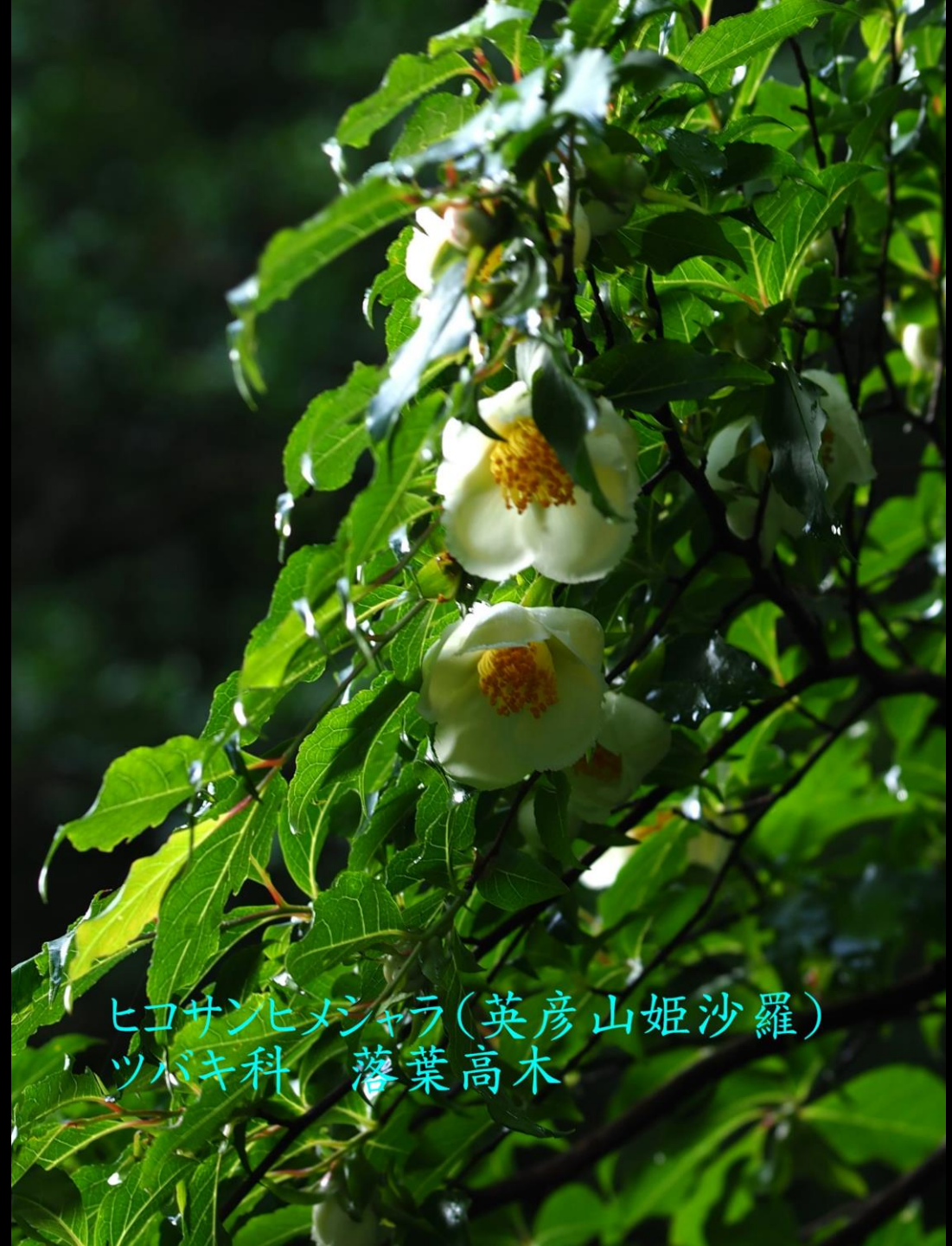
ヒコサンヒメジャラ(英彦山姫沙羅) ツバキ科 落葉高木