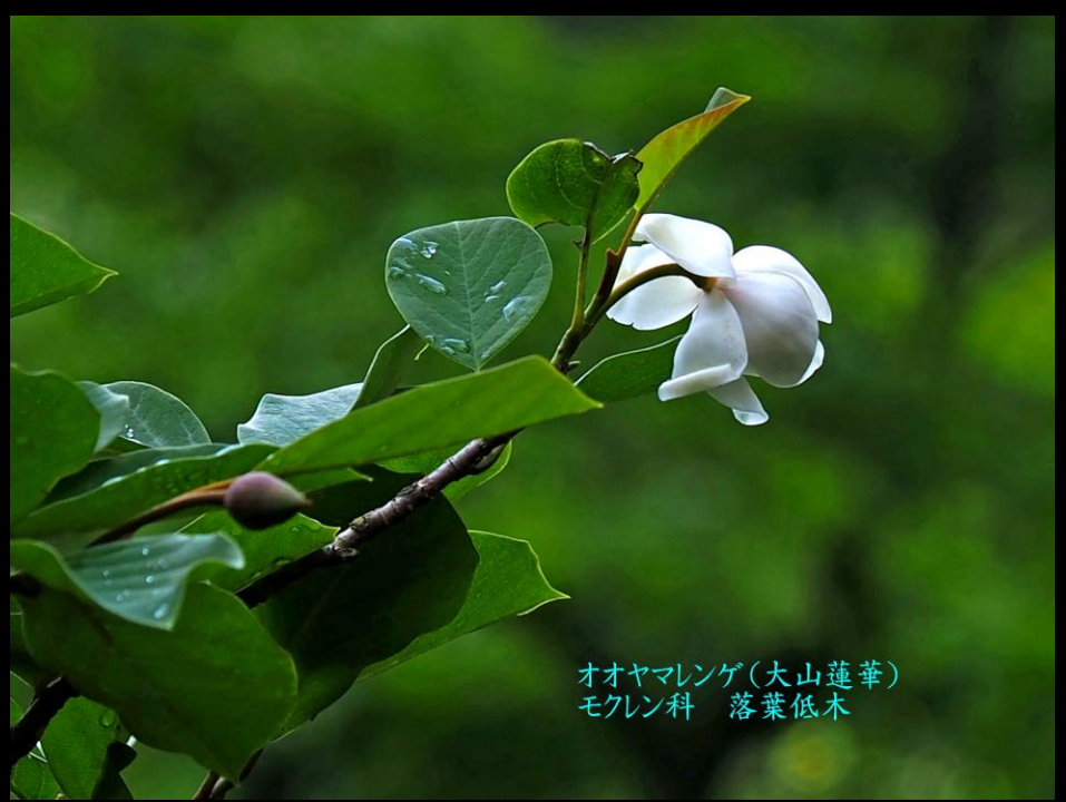
オオヤマレンゲ(大山蓮華) モクレン科 落葉低木