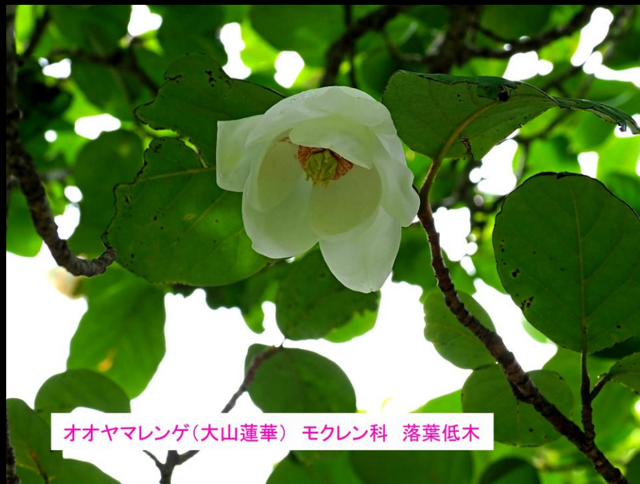
オオヤマレンゲ(大山蓮華) モクレン科 落葉低木