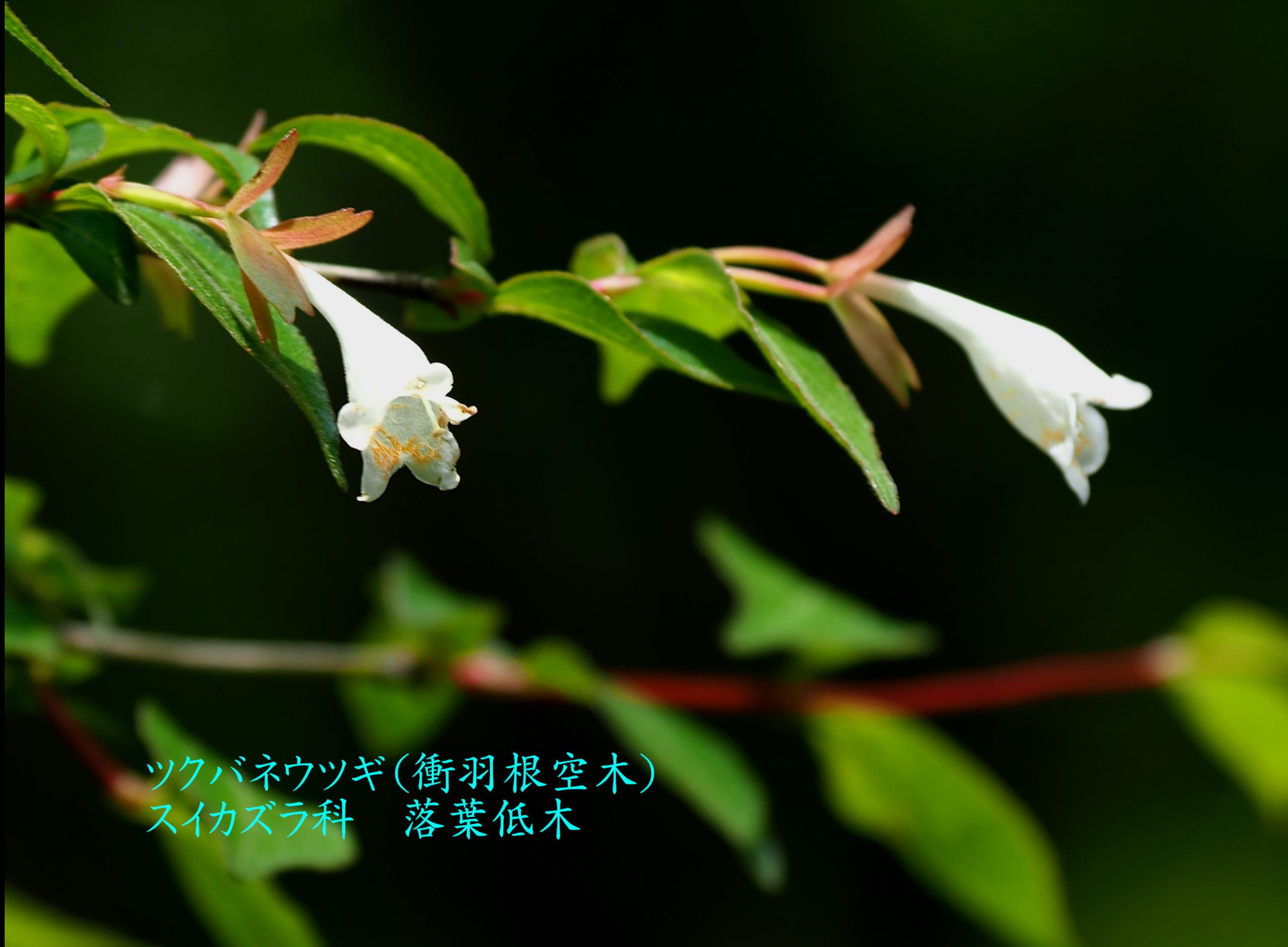
ツクバネウツギ(衝羽根空木) スイカズラ科 落葉低木