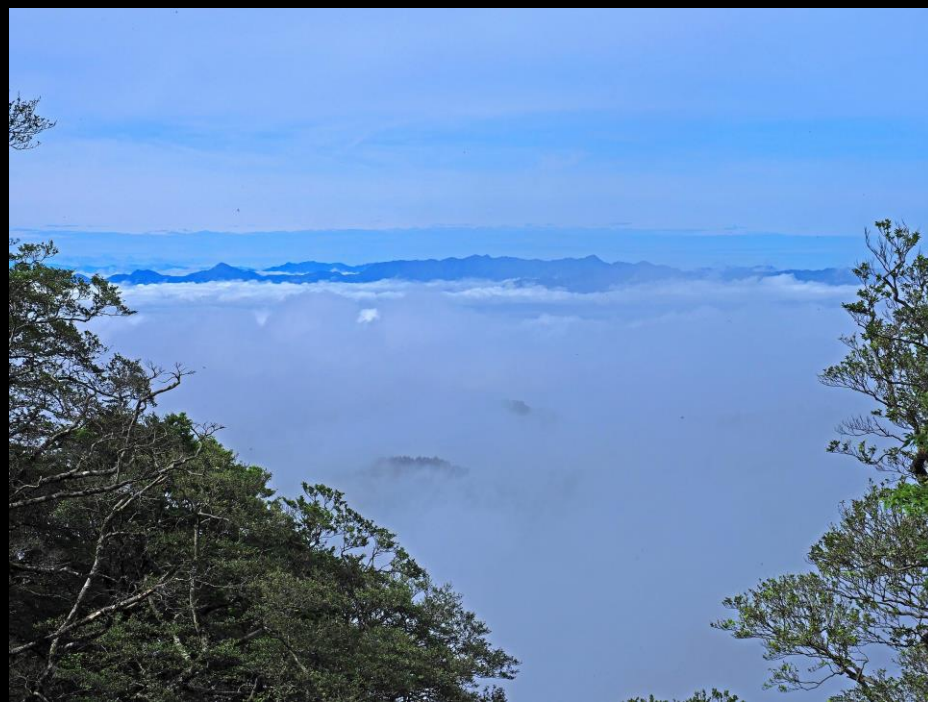
8:40 英彦山・北岳1192mからの展望