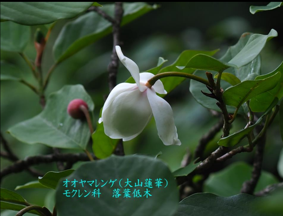
オオヤマレンゲ(大山蓮華) モクレン科 落葉低木