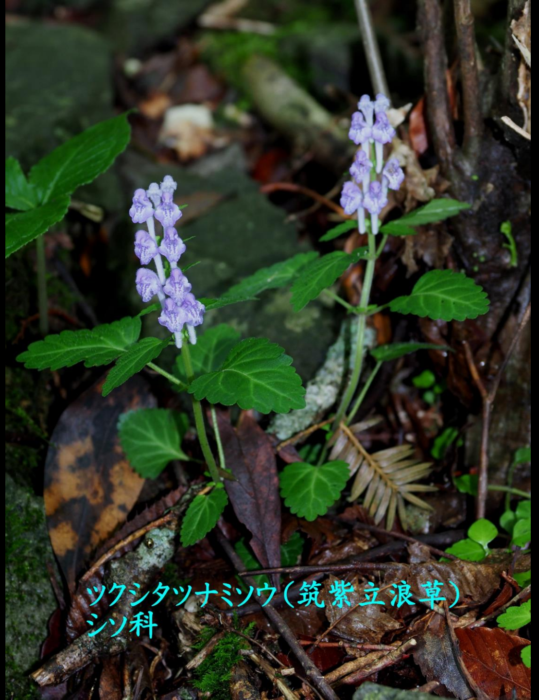
ツクシタツナミソウ(筑紫立浪草) シソ科