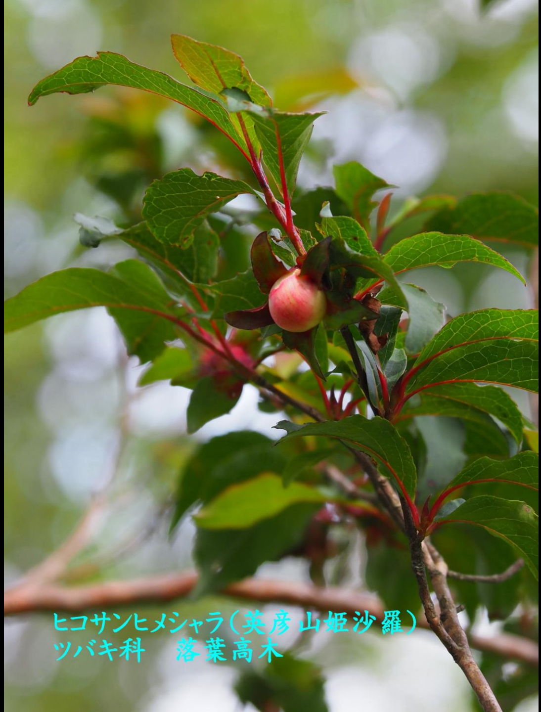
ヒコサンヒメジャラ(英彦山姫沙羅) ツバキ科 落葉高木