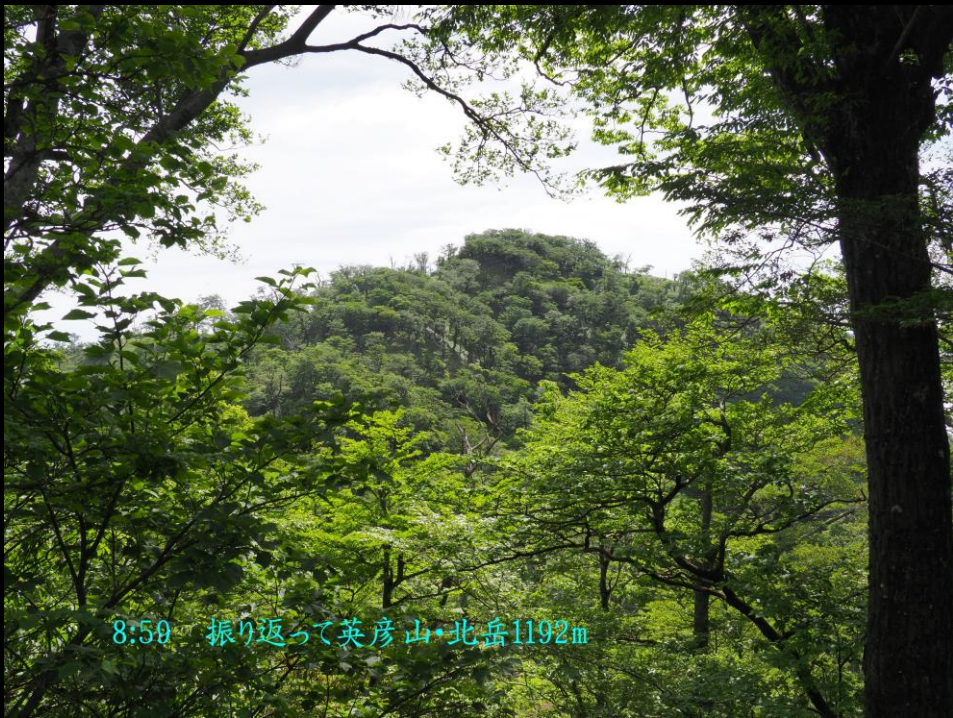
8:50 振り返って英彦山・北岳1192m