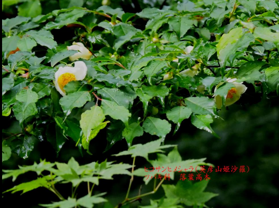
ヒコサンヒメジャラ(英彦山姫沙羅) ツバキ科 落葉高木