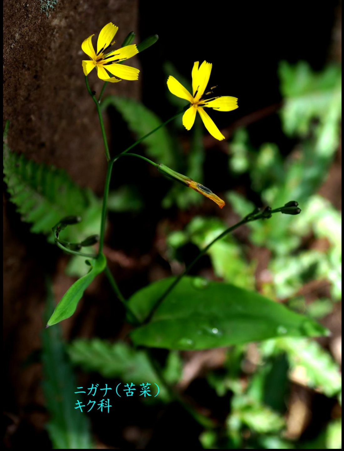
ニガナ(苦菜) キク科