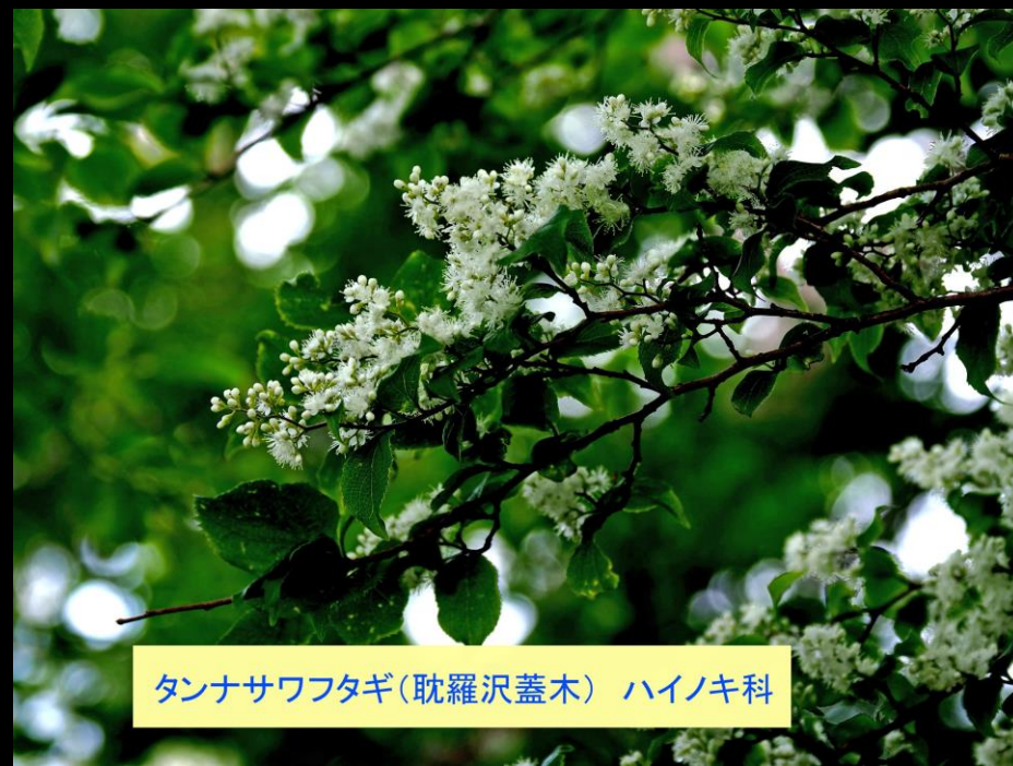
タンナサワフタギ(耽羅沢蓋木) ハイノキ科