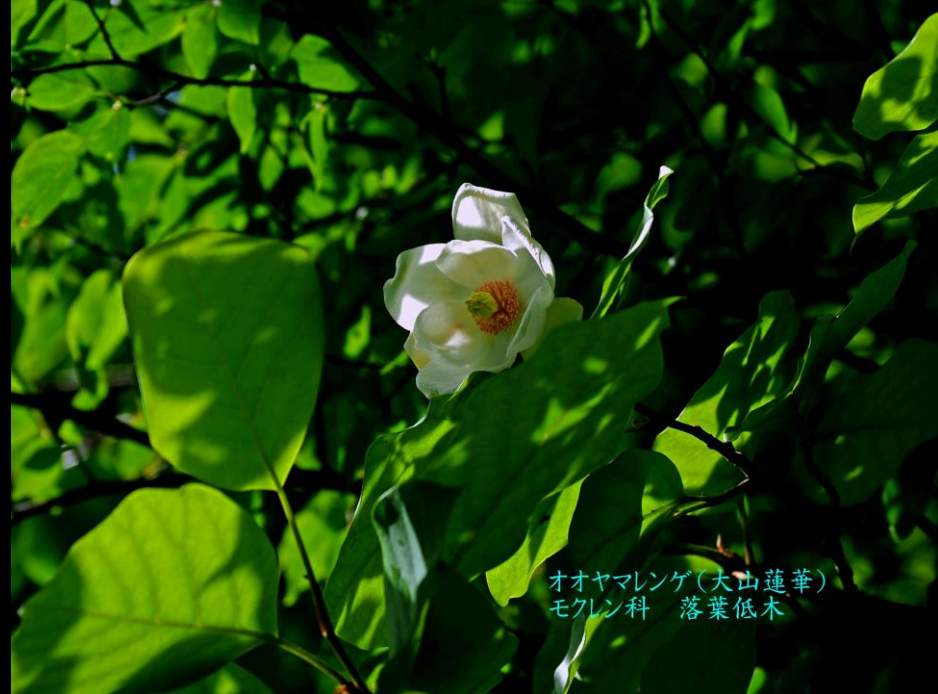
オオヤマレンゲ(大山蓮華) モクレン科 落葉低木