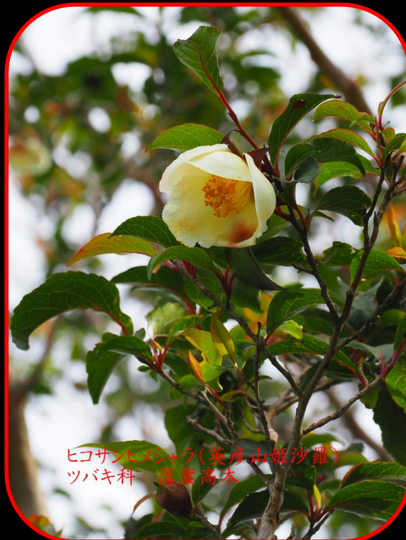
ヒコサンヒメシャラ(英彦山姫沙羅) ツバキ科 落葉高木