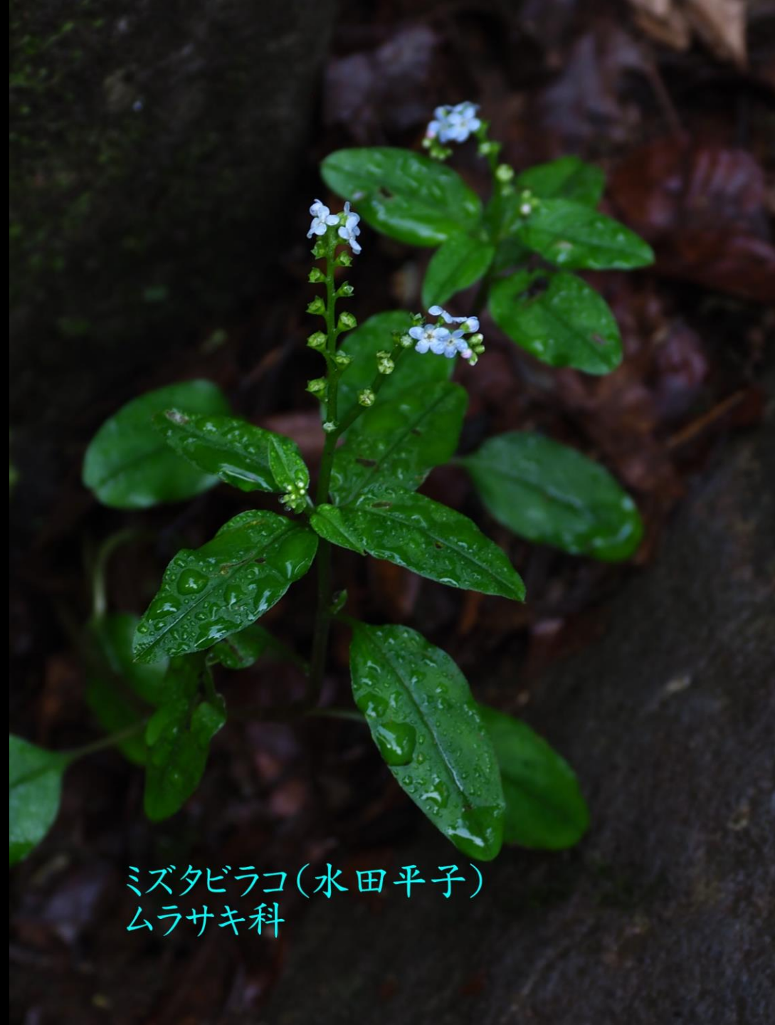
ミズタビラコ(水田平子) ムラサキ科