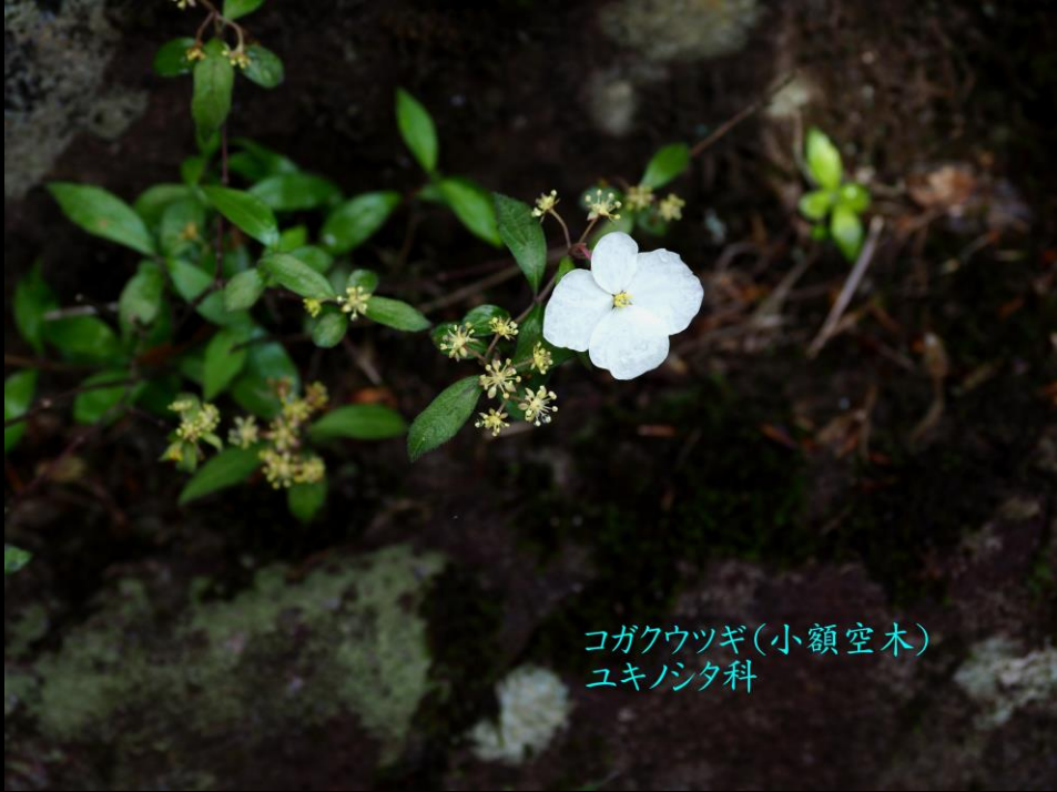
コガクウツギ(小額空木) ユキノシタ科