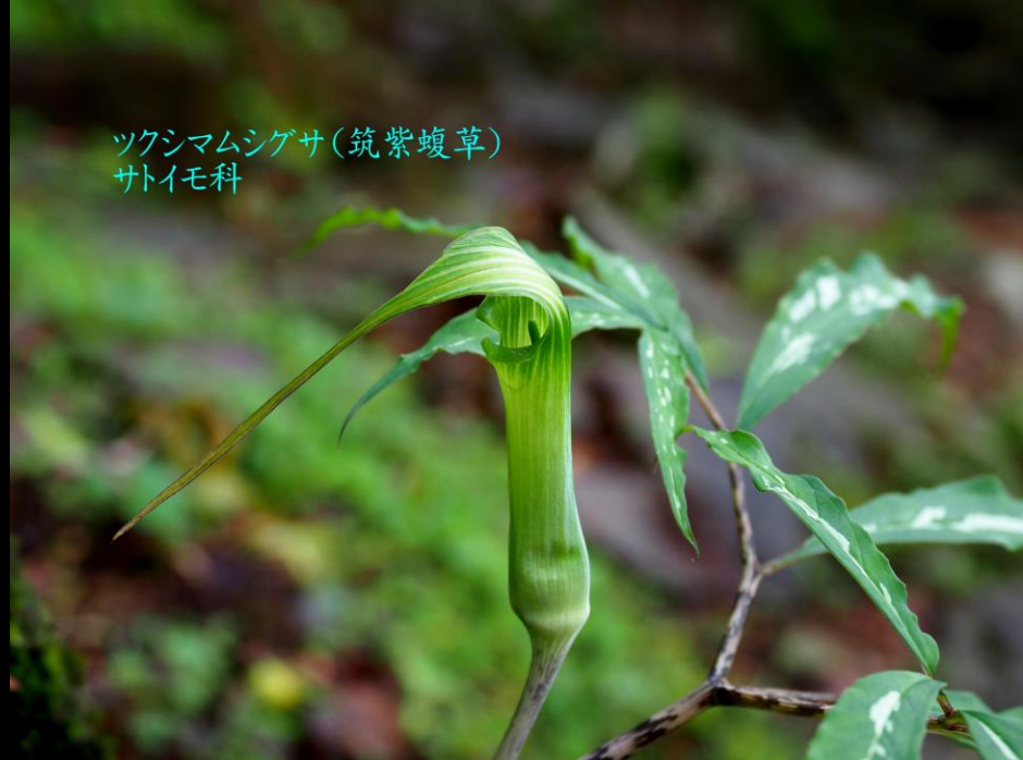
ツクシマムシゲサ(筑紫蝮草) サトイモ科