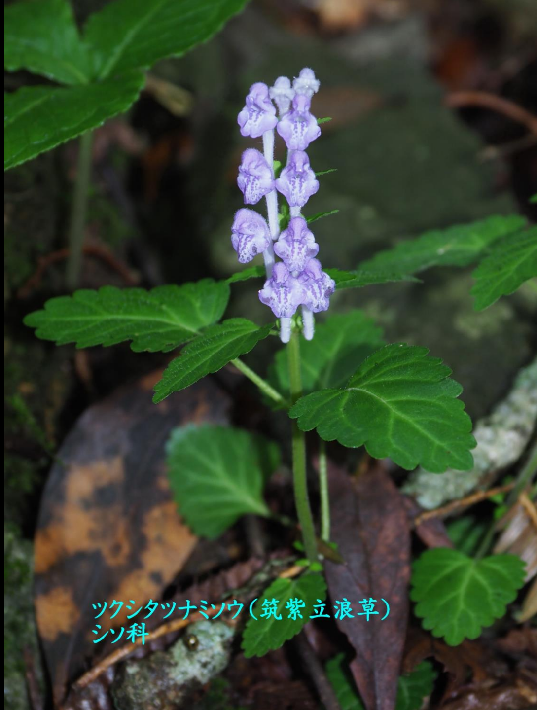
ツクシタツナミソウ(筑紫立浪草) シソ科