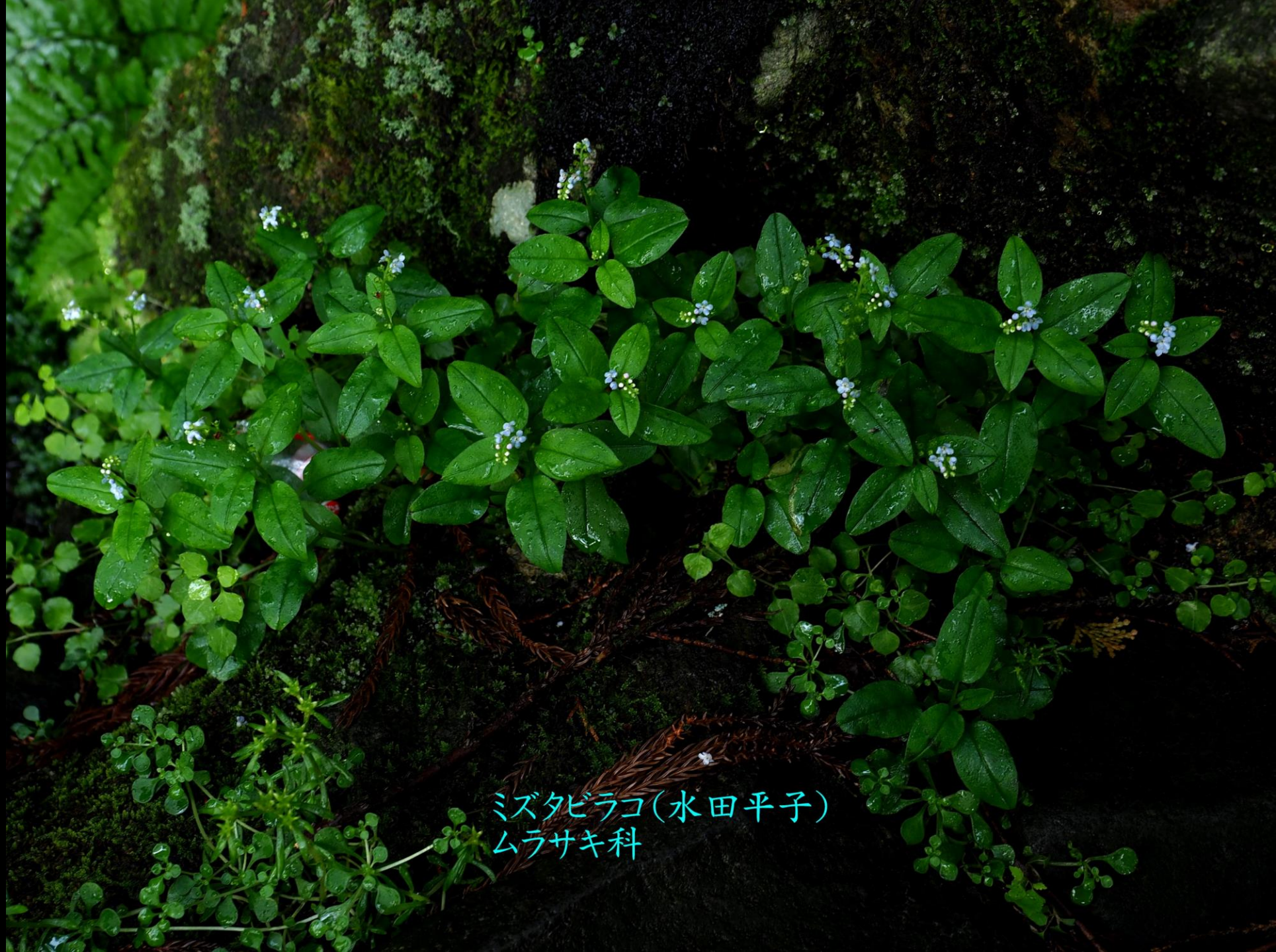
ミズタビラコ(水田平子) ムラサキ科