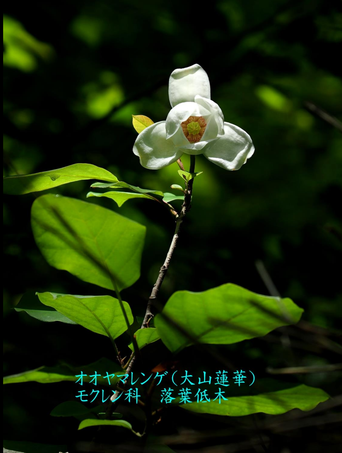
オオヤマレンゲ(大山蓮華) モクレン科 落葉低木