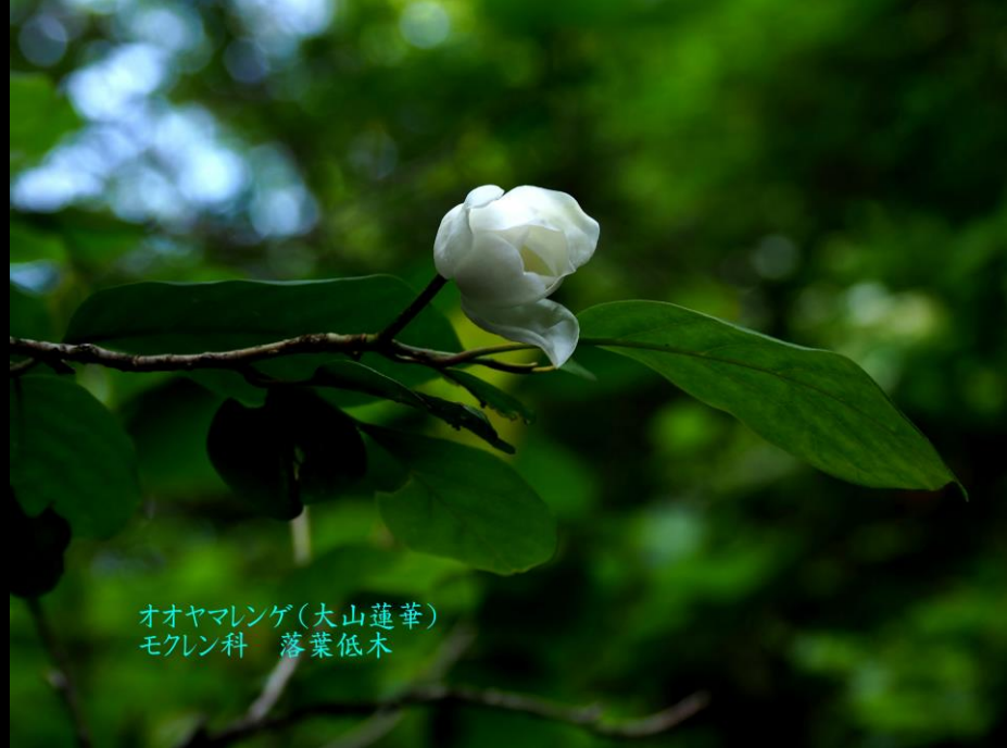
オオヤマレンゲ(大山蓮華) モクレン科 落葉低木