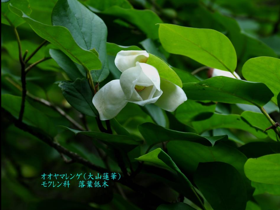
オオヤマレンゲ(大山蓮華) モクレン科 落葉低木