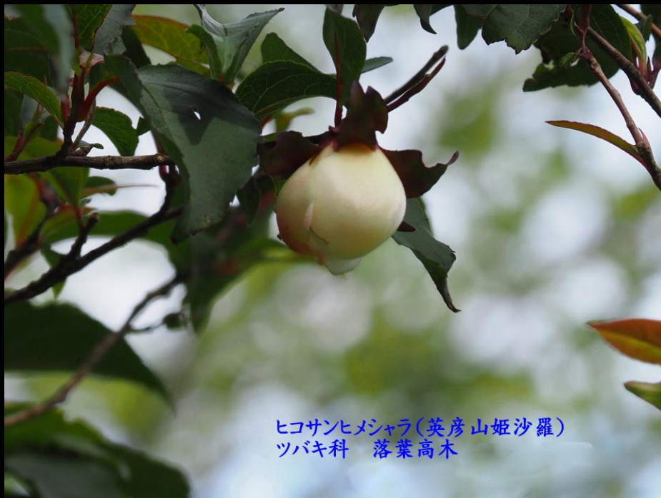
ヒコサンヒメジャラ(英彦山姫沙羅) ツバキ科 落葉高木