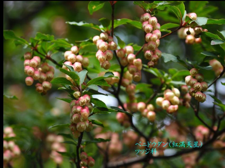
ベニドウダン(紅満天星) ツツジ科