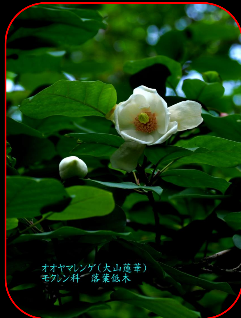
オオヤマレンゲ(大山蓮華) モクレン科 落葉低木