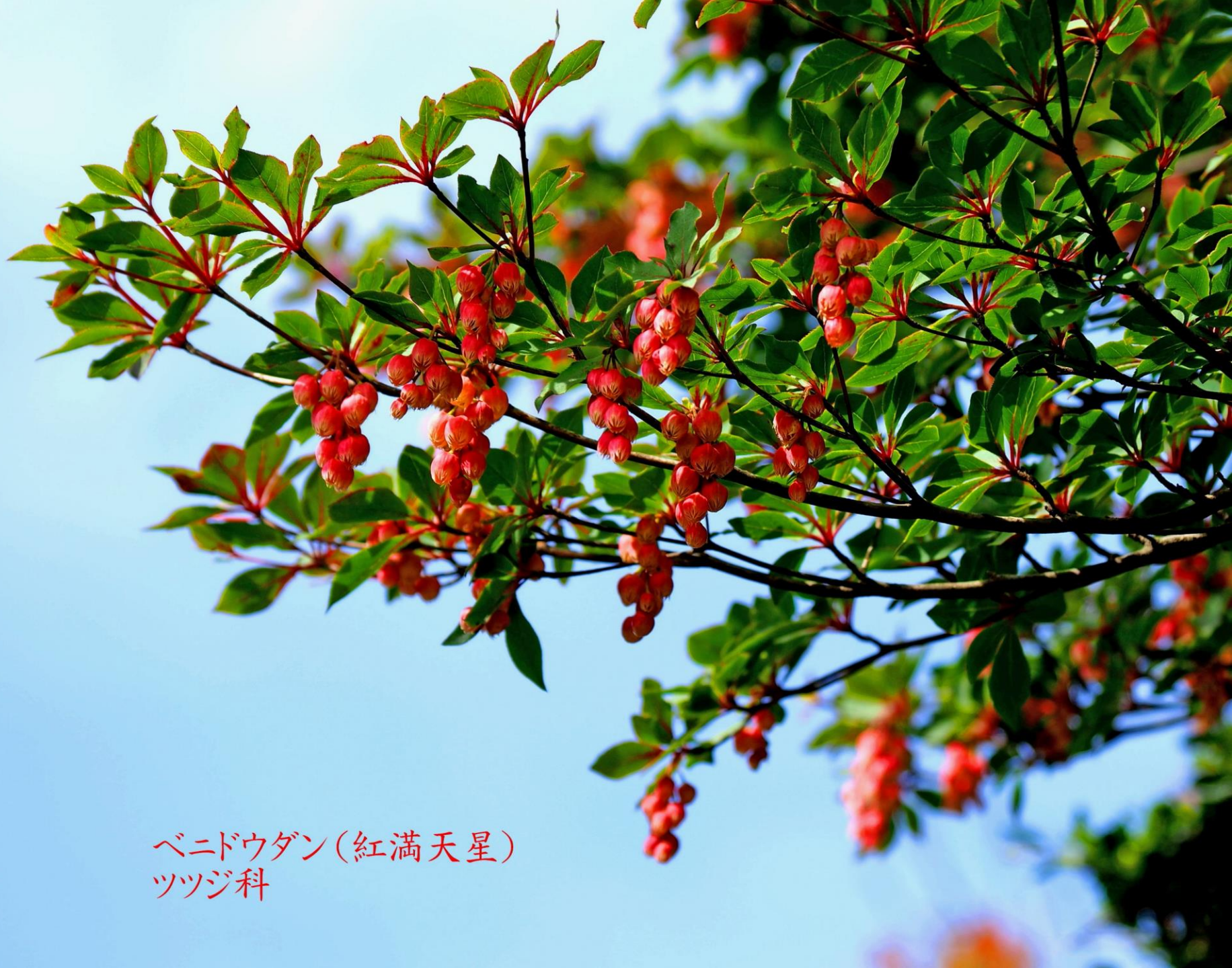
ベニドウダン(紅満天星) ツツジ科