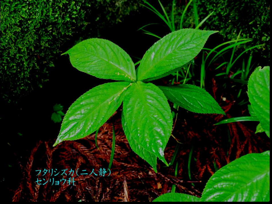
フタリスズカ(二人静) センリョウ科