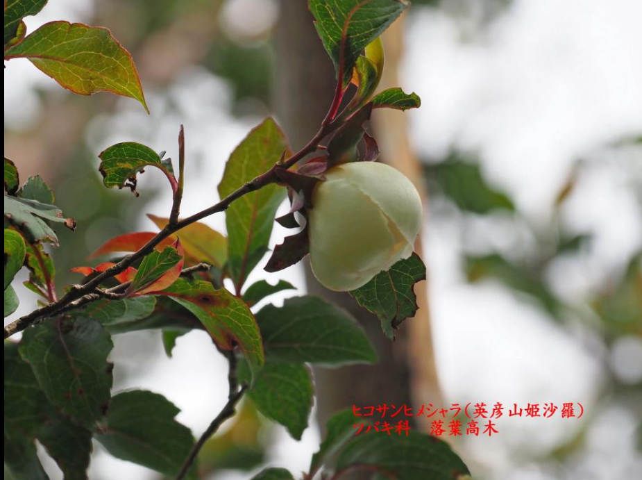
ヒコサンヒメジャラ(英彦山姫沙羅) ツバキ科 落葉高木