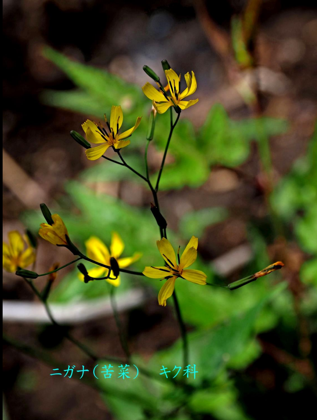
ニガナ(苦菜) キク科