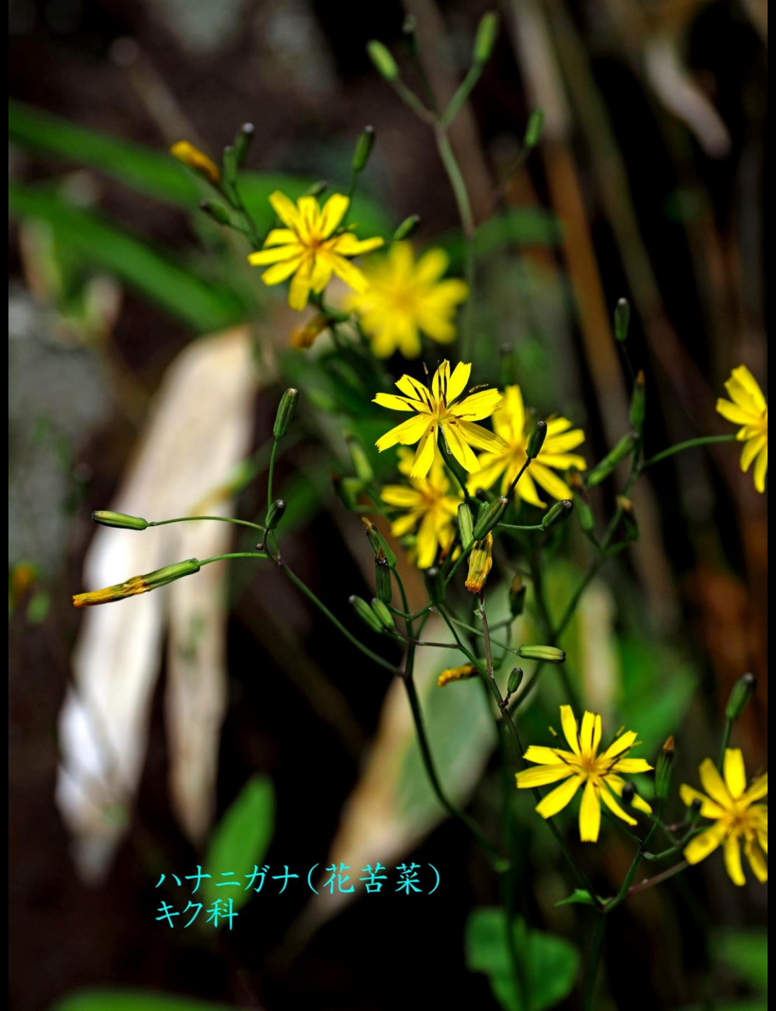
ハナニガナ(花苦菜) キク科