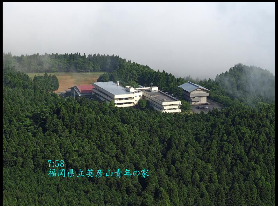
7:58 福岡県立英彦山青年の家