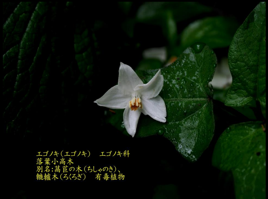
エゴノキ(エゴノキ) エゴノキ科 落葉小高木 別名: 萬苜の木(ちしゃのき)、 轆轤木(ろくろぎ) 有毒植物