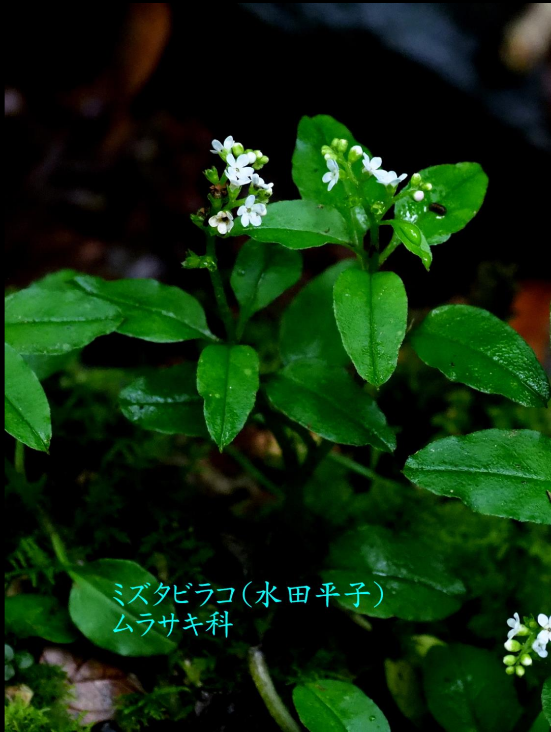
ミズタビラコ(水田平子) ムラサキ科