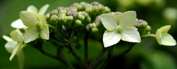
ヤマアジサイ(山紫陽花) アジサイ科 落葉低木