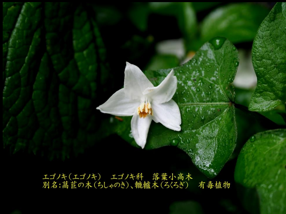
エゴノキ(エゴノキ) エゴノキ科 落葉小高木 別名:葛苺の木(ちしゃのき)、鞭轆木(ろくろぎ) 有毒植物