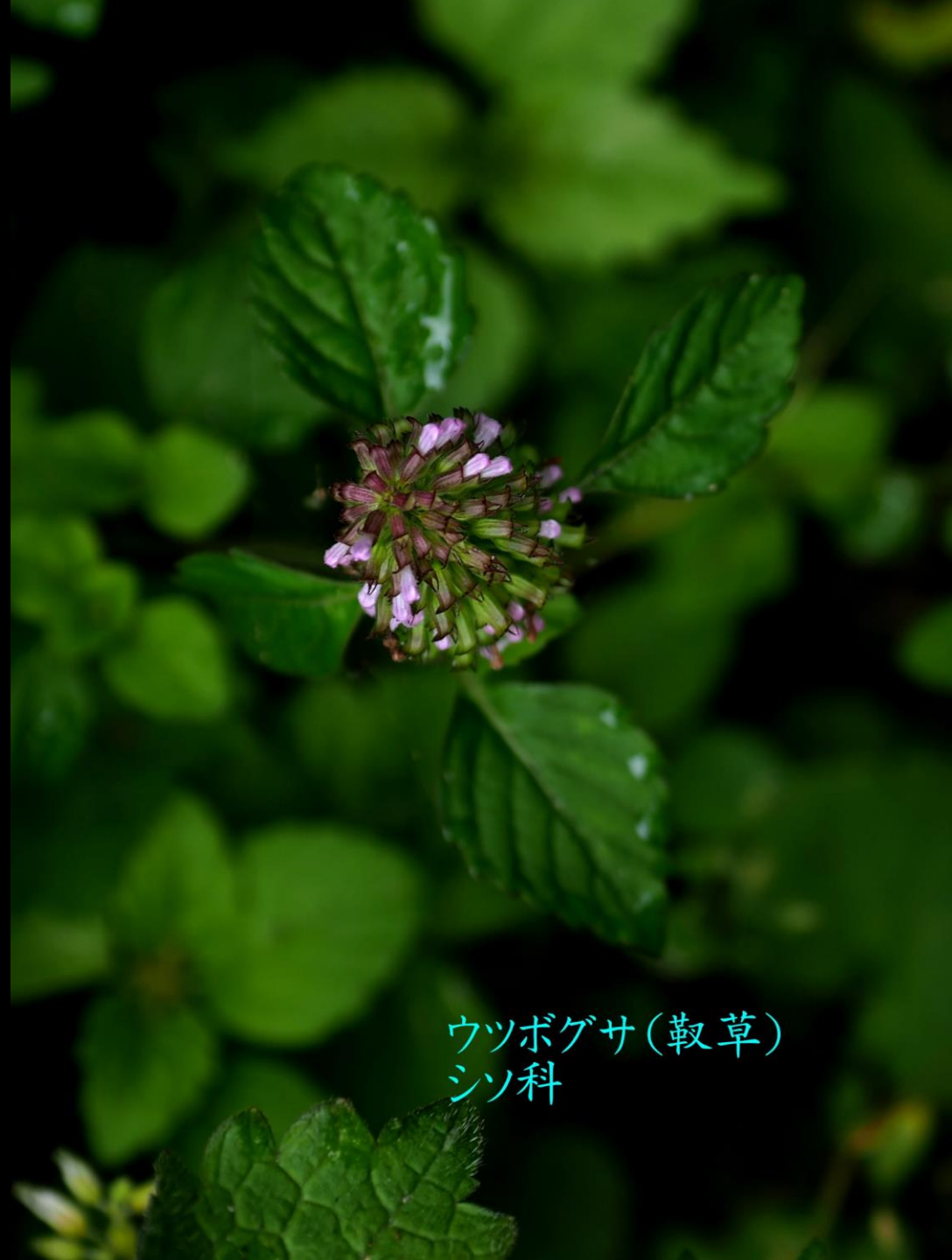
ウツボグサ(靱草) シソ科