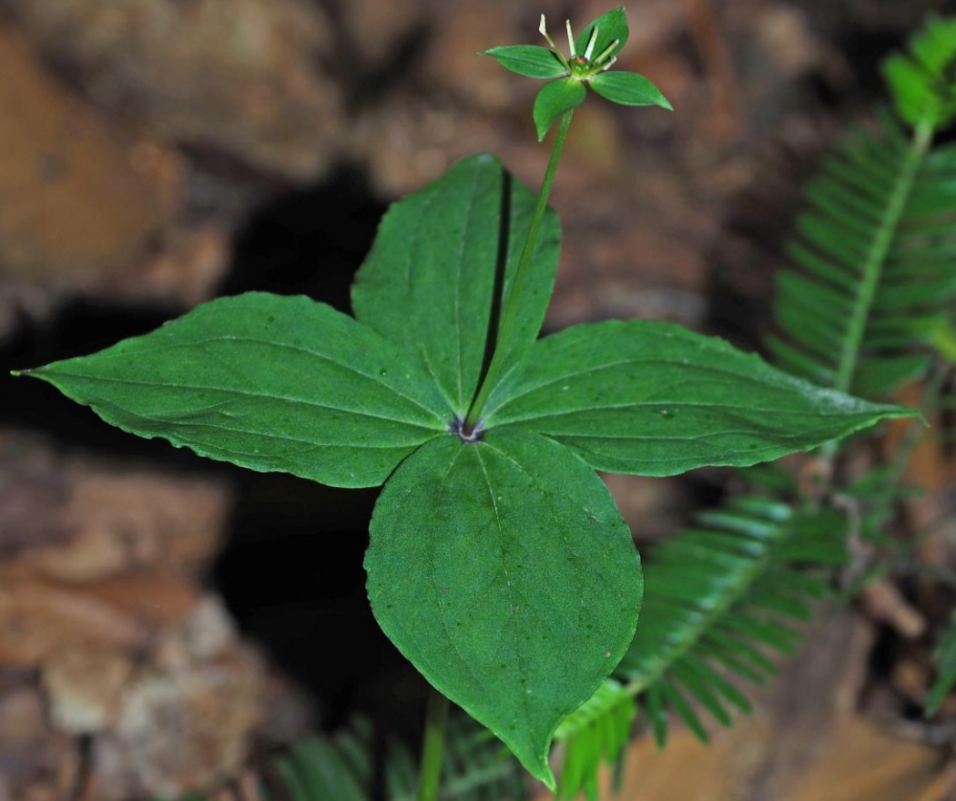
ツクバネソウ(衝羽根草) ユリ科