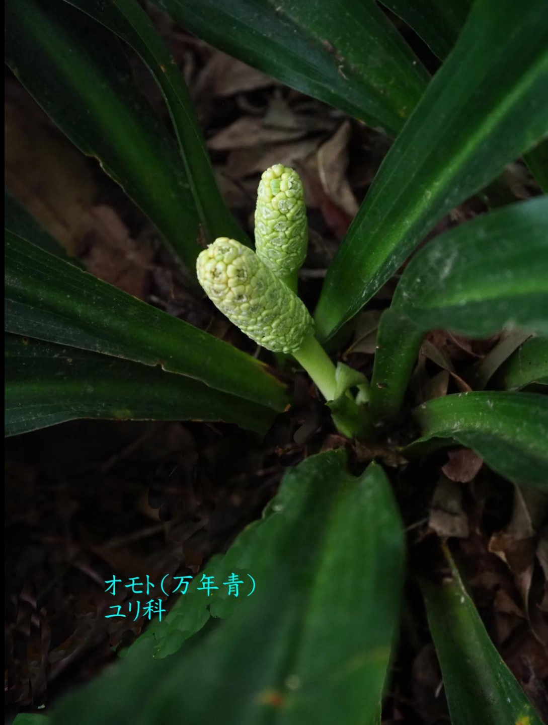
オモト(万年青) ユリ科