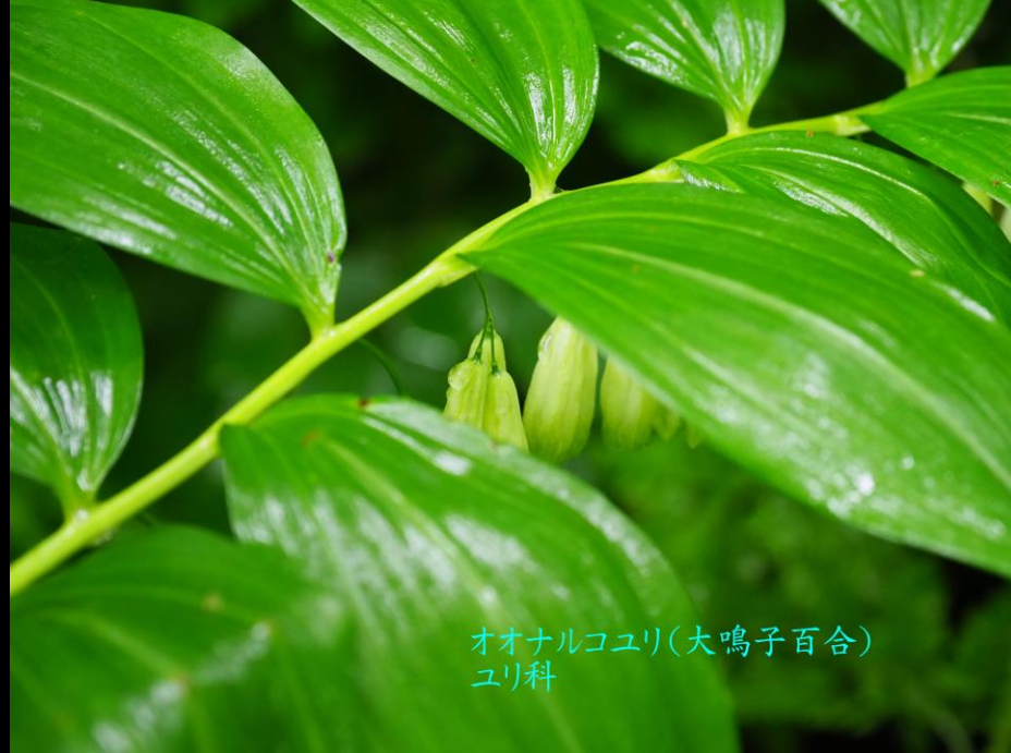
オオナルコユリ(大鳴子百合) ユリ科