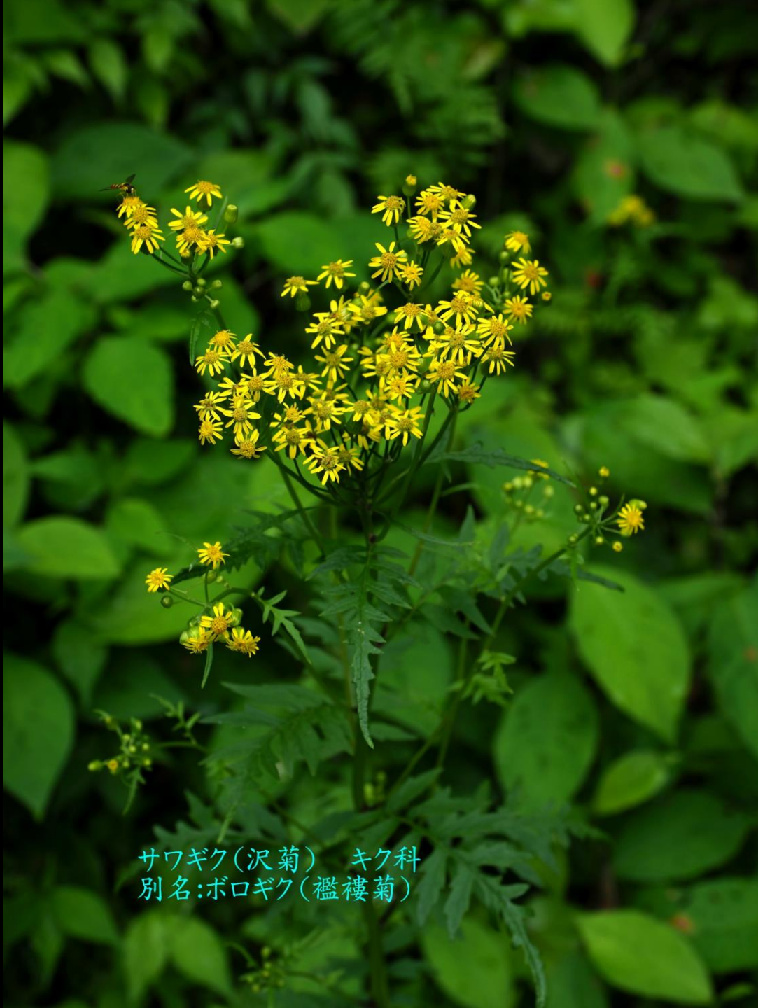
サワギク(沢菊) キク科 別名:ボロギク(襤褸菊)