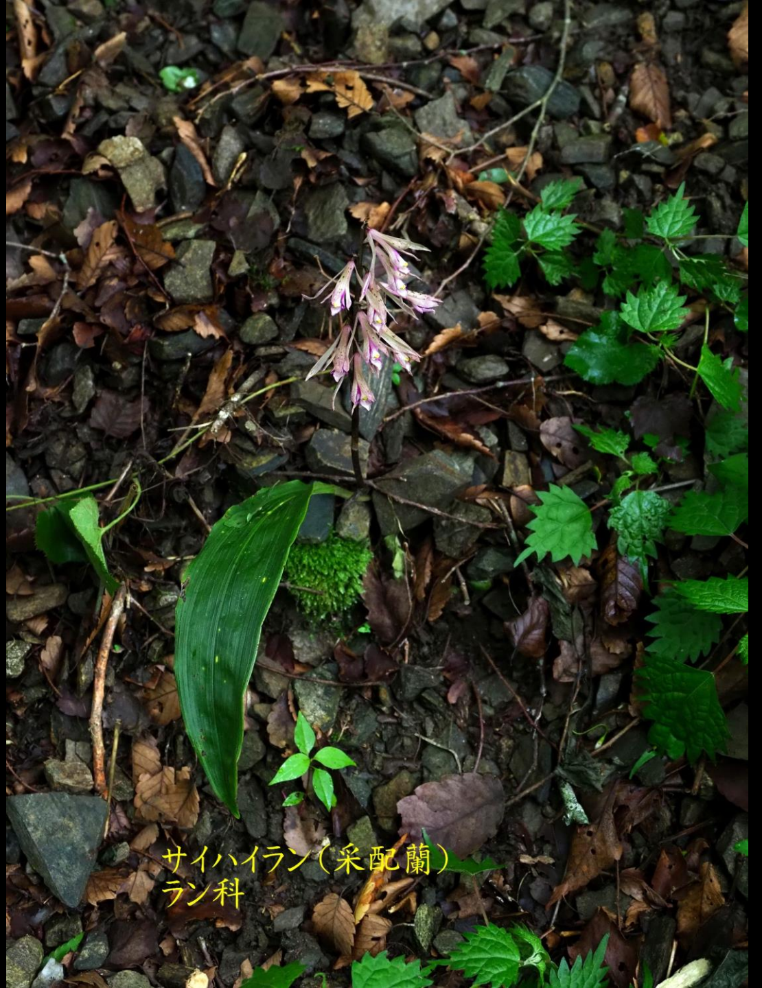
サイハイラン(采配蘭) ラン科