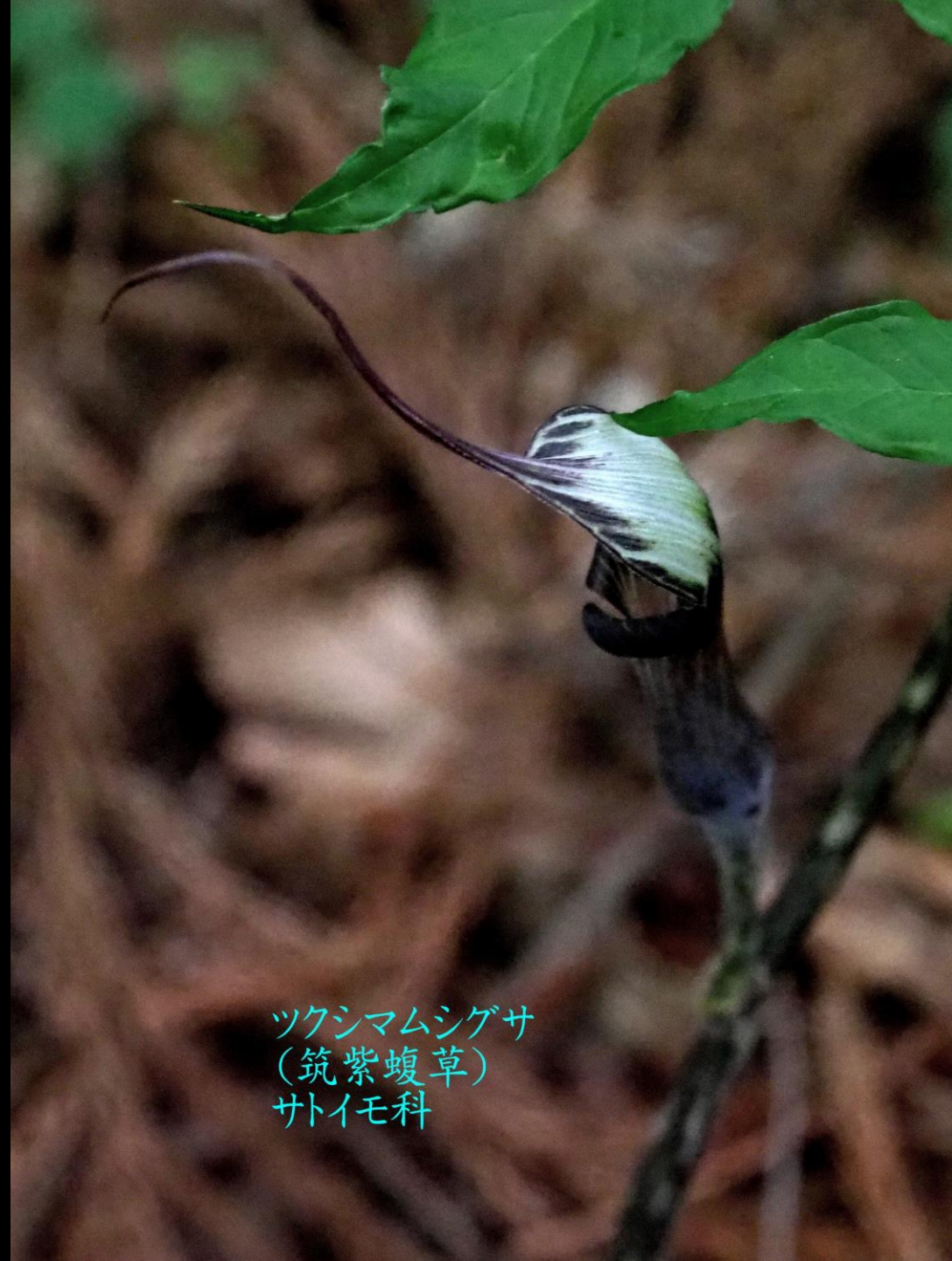
ツクシマムシゲサ (筑紫蝮草) サトイモ科