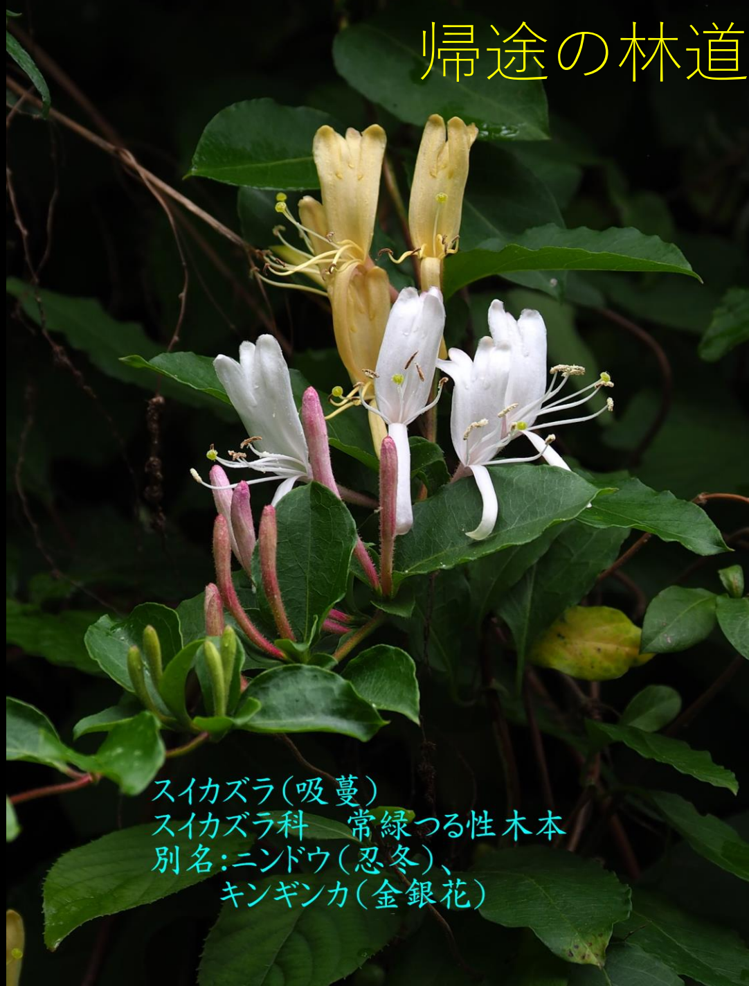
スイカズラ(吸蔓) スイカズラ科 常緑つる性木本 別名:ニンドウ(忍冬)、 キンギンカ(金銀花)