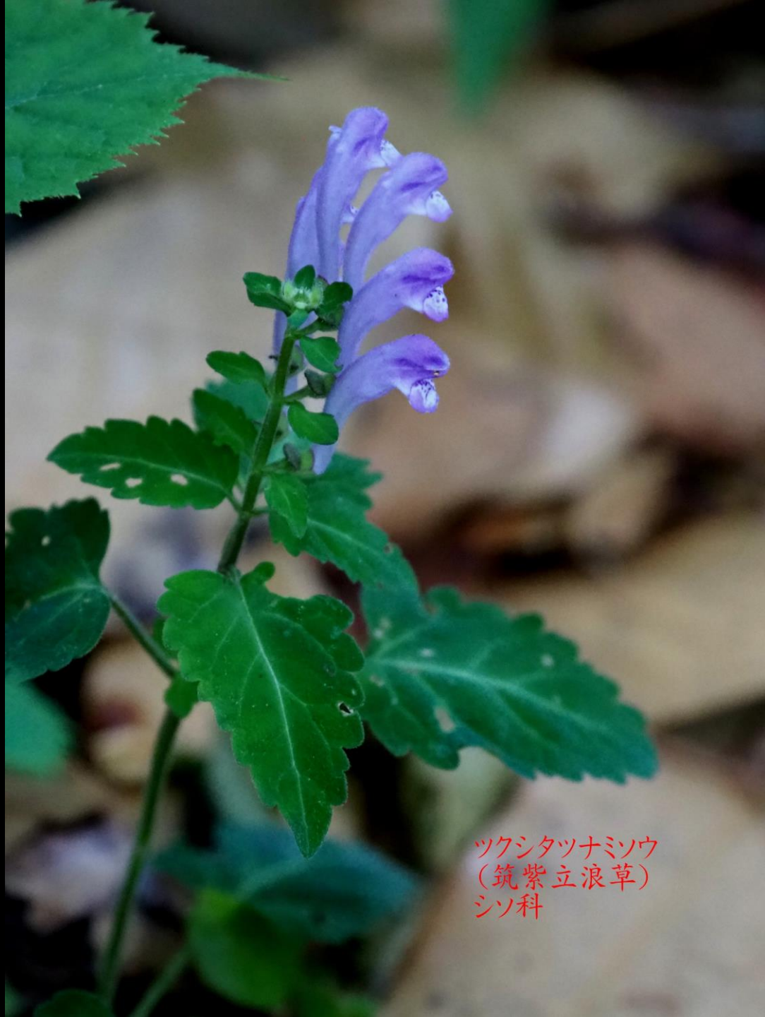
ツクシタツナミソウ (筑紫立浪草) シソ科