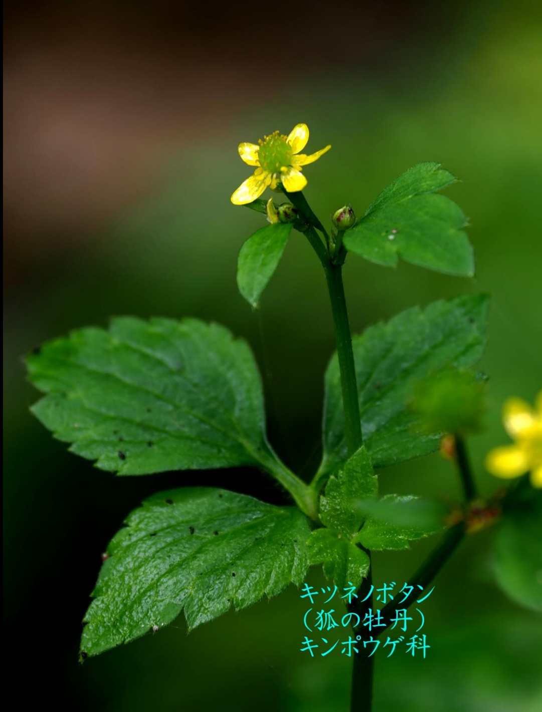
キツネノボタン (狐の牡丹) キンポウゲ科