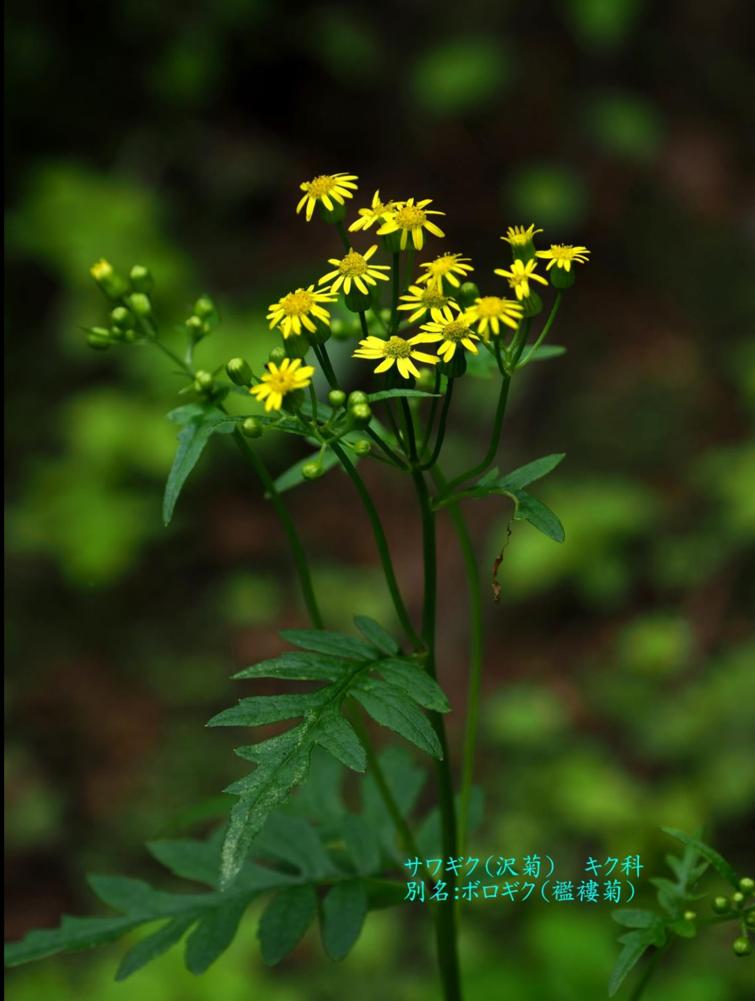
サワギク(沢菊) キク科 別名:ボロギク(襤褸菊)