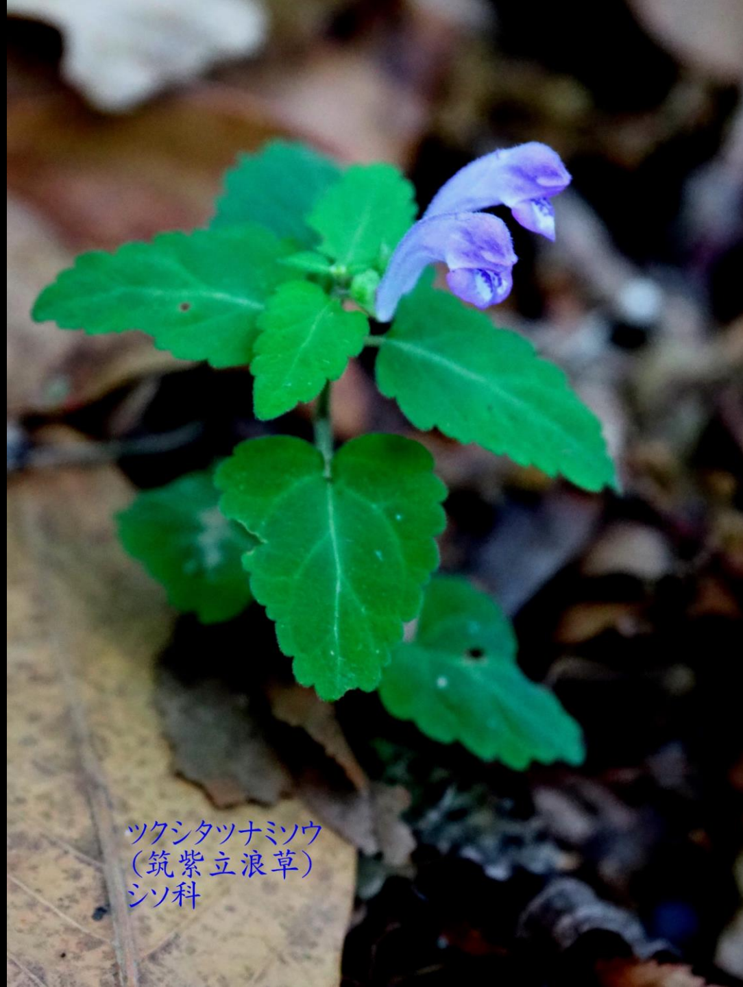
ツクシタツナミソウ (筑紫立浪草) シソ科