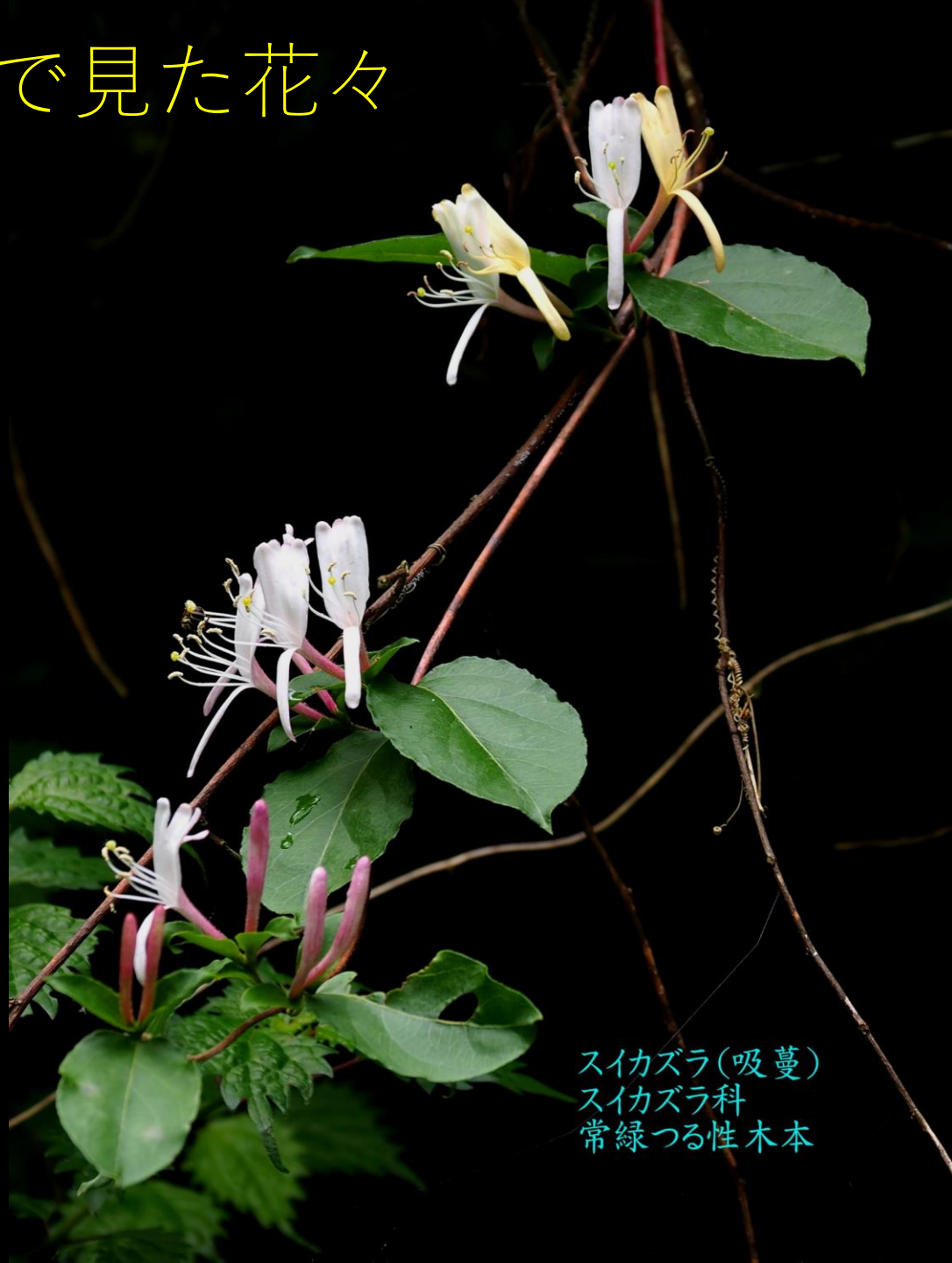
スイカズラ(吸蔓) スイカズラ科 常緑つる性木本