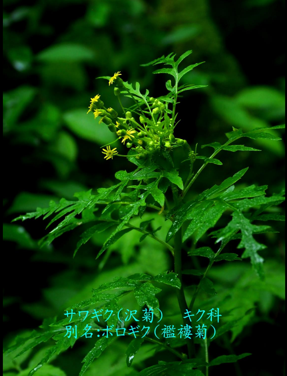
サワギク(沢菊) キク科 別名:ボロギク(襤褸菊)