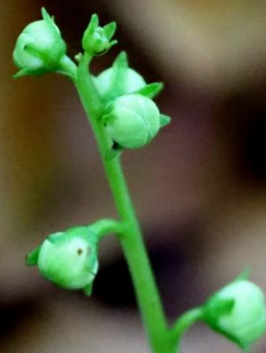
マルバノイチヤクソウ (丸葉の一薬草) ツツジ科