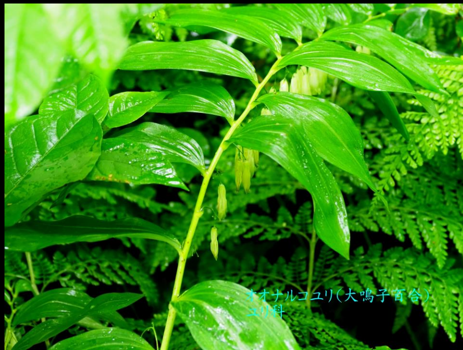
オオナルコユリ(大鳴子百合) ユリ科