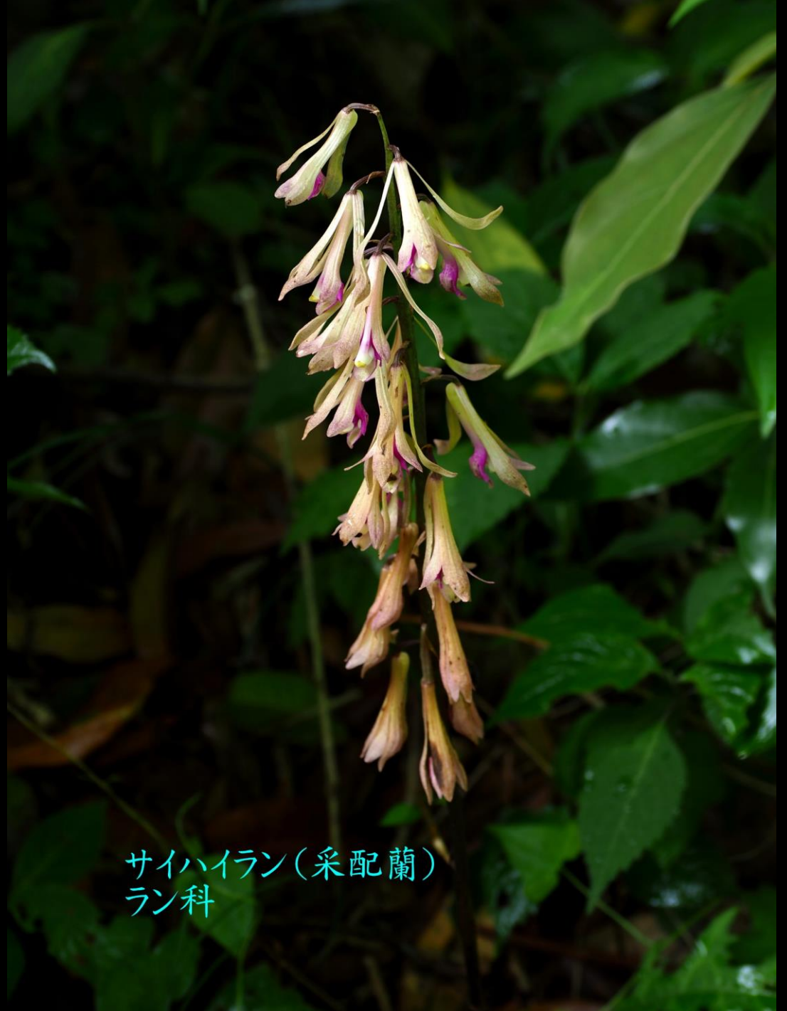
サイハイラン(采配蘭) ラン科