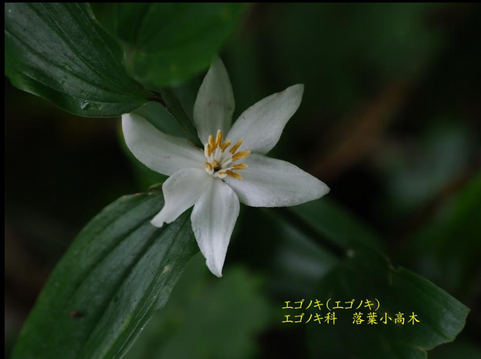
エゴノキ(エゴノキ) エゴノキ科 落葉小高木