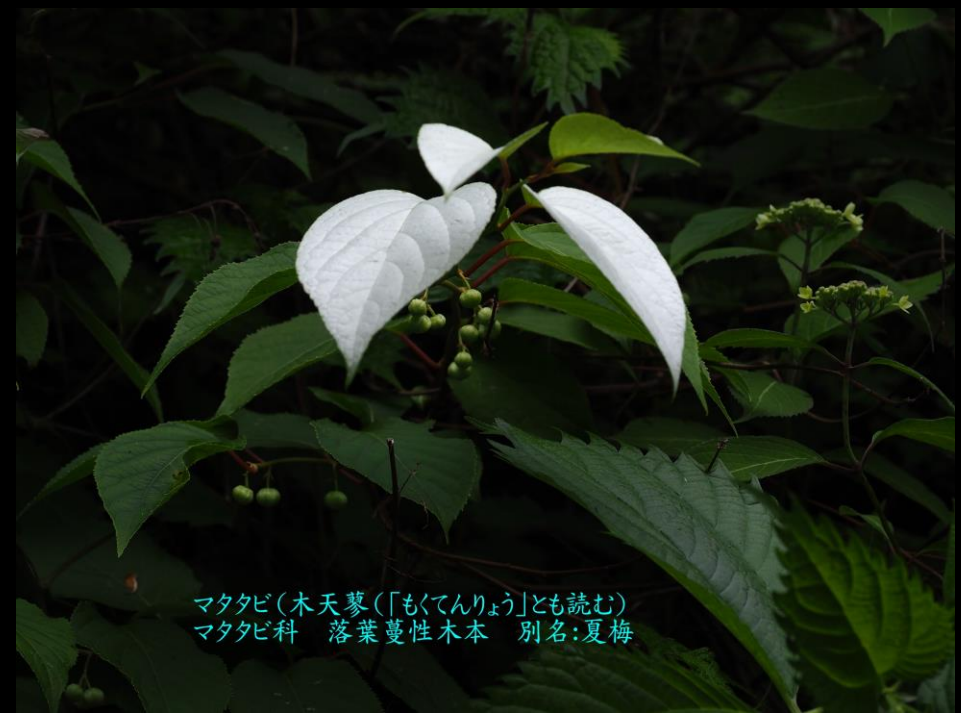
マタタビ(木天蓼(「もくてんりょう」とも読む)) マタタビ科 落葉蔓性木本 別名:夏梅