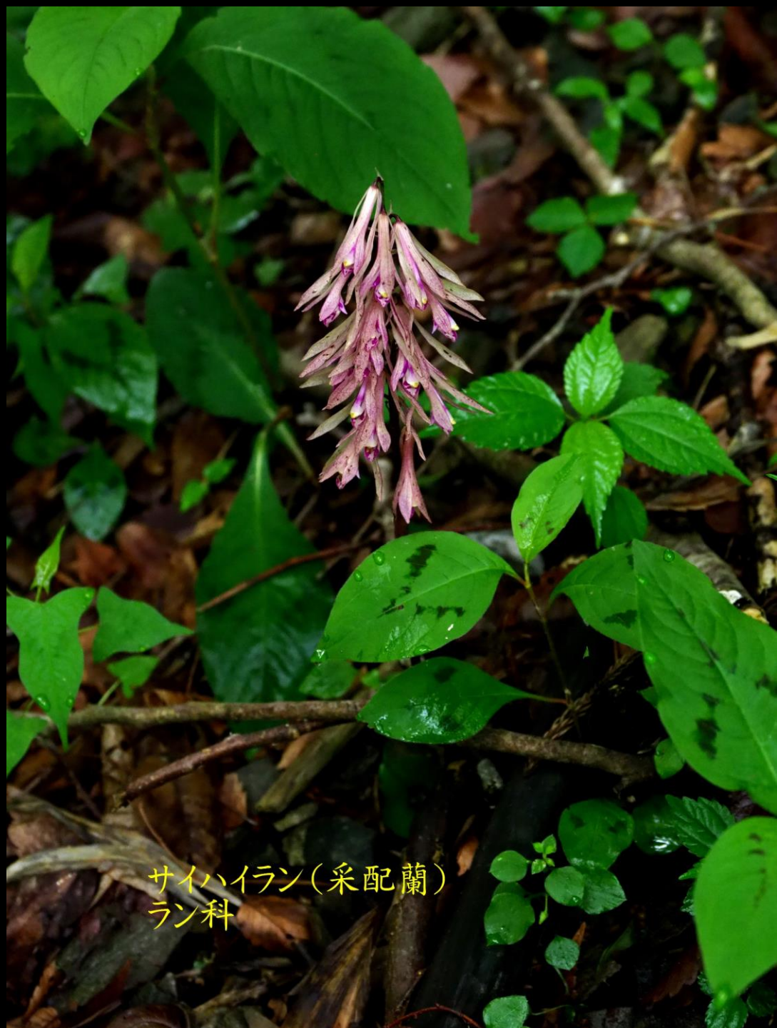
サイハイラン(采配蘭) ラン科