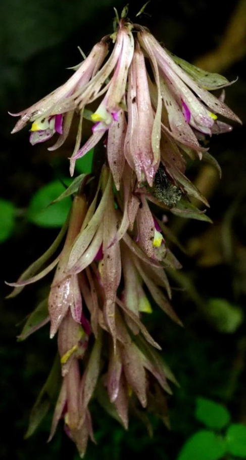
サイハイラン(采配蘭) ラン科