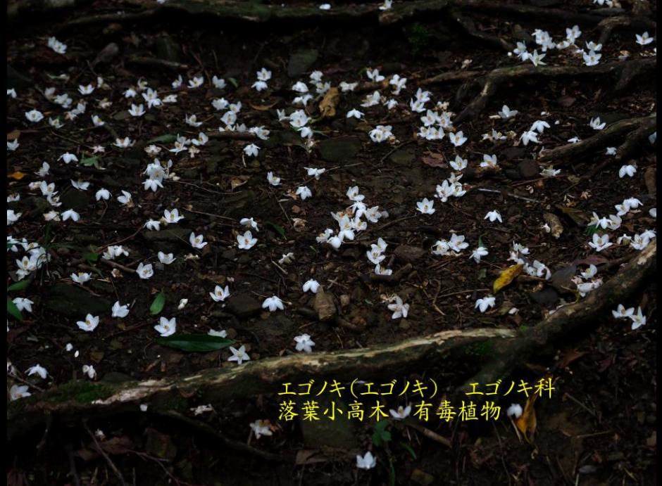
エゴノキ(エゴノキ) エゴノキ科 落葉小高木 有毒植物