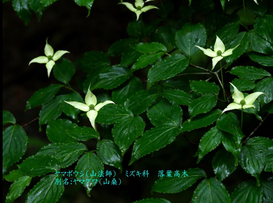
ヤマボウシ(山法師) ミズキ科 落葉高木 別名:ヤマグワ(山桑)