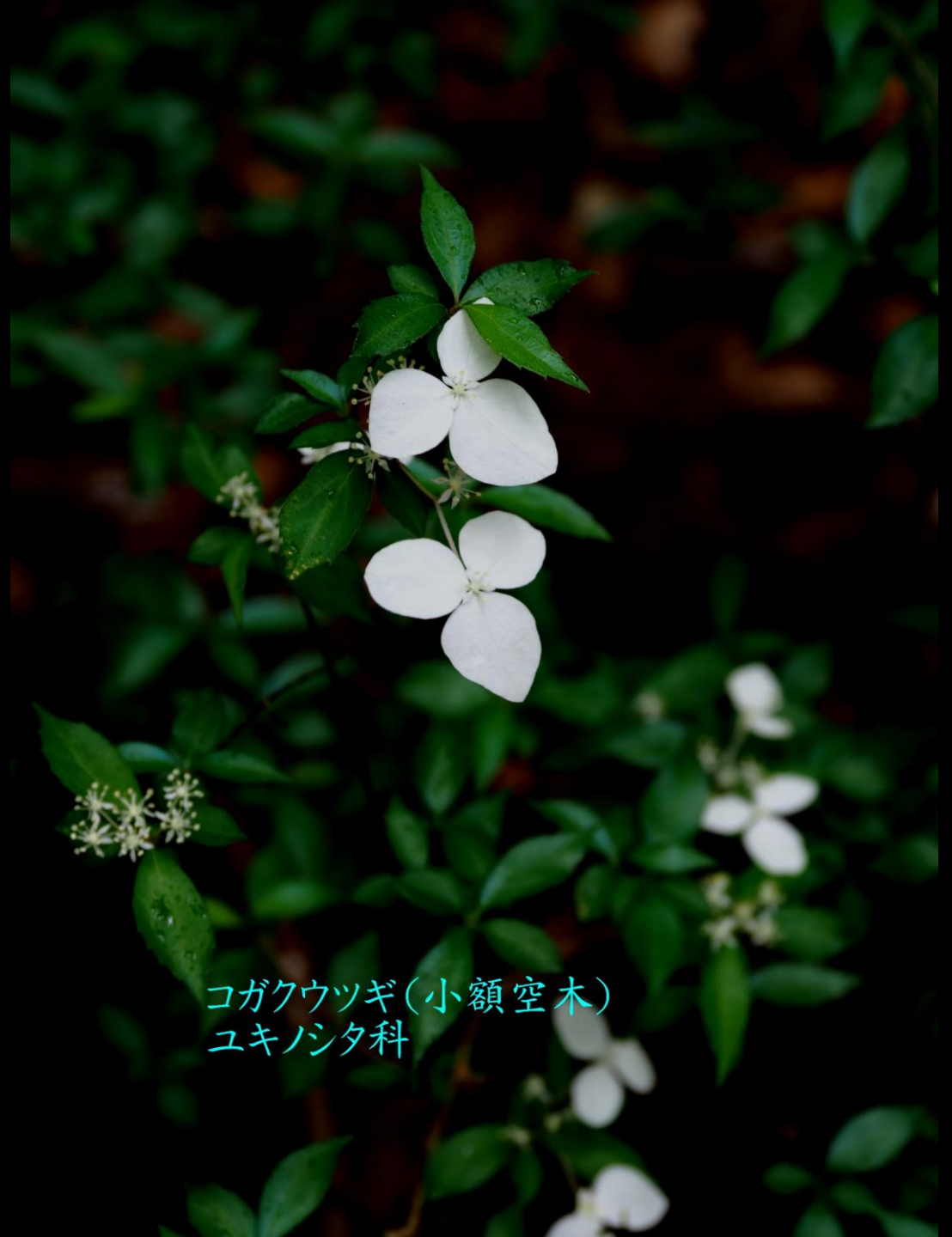
コガクウツギ(小額空木) ユキノシタ科