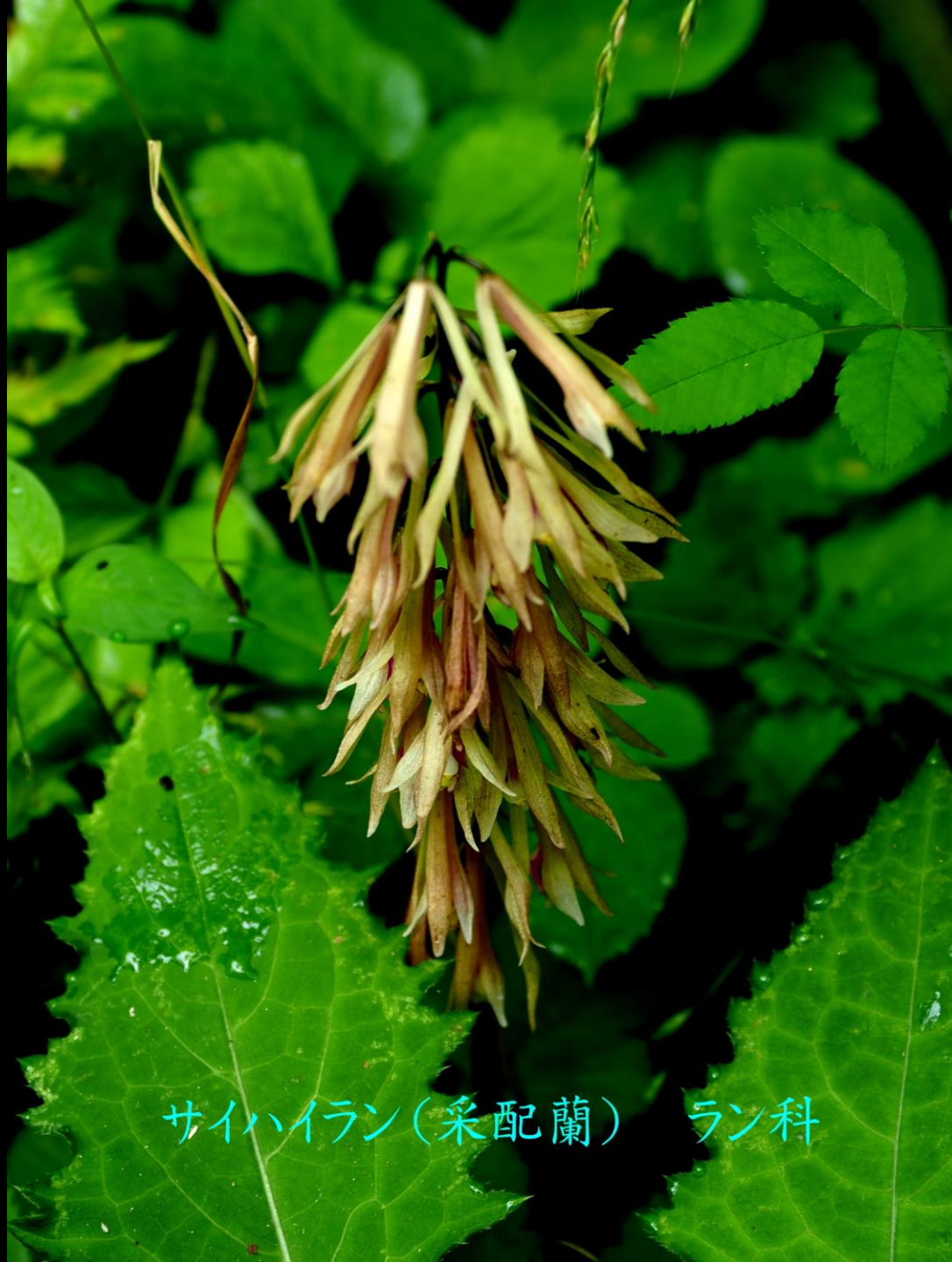
サイハイラン(采配蘭) ラン科