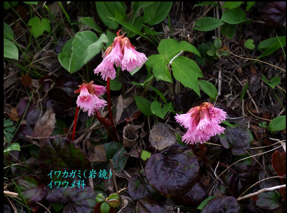
イワカガミ(岩鏡) イワウメ科