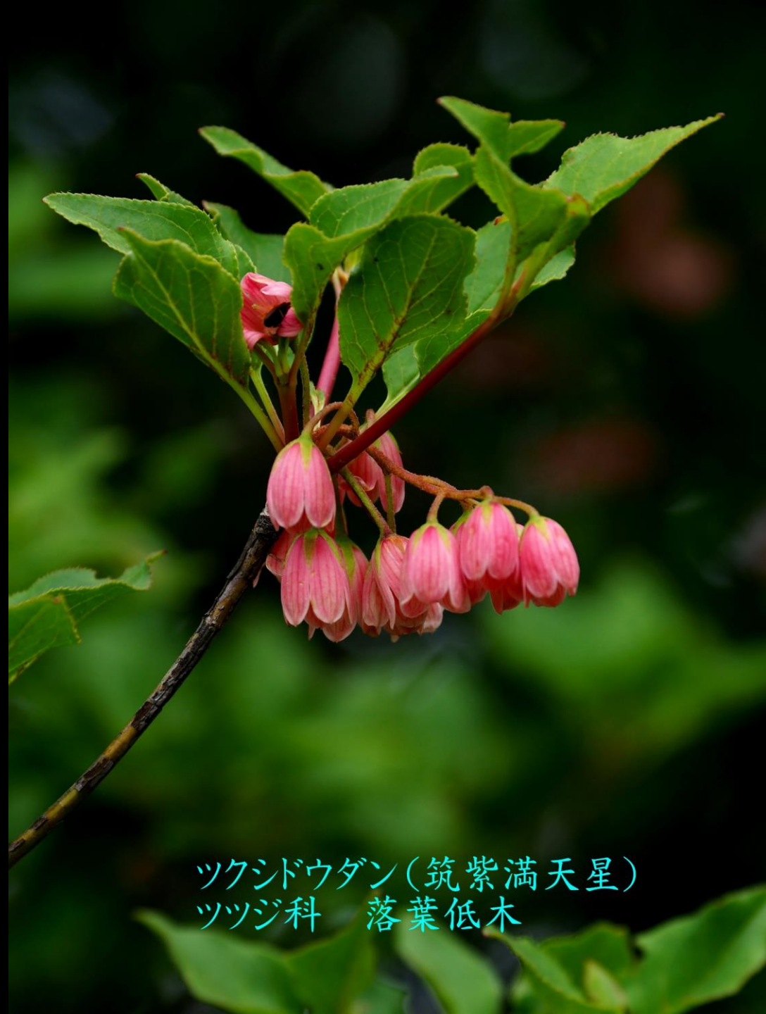
ツクシドウダン(筑紫満天星) ツツジ科 落葉低木