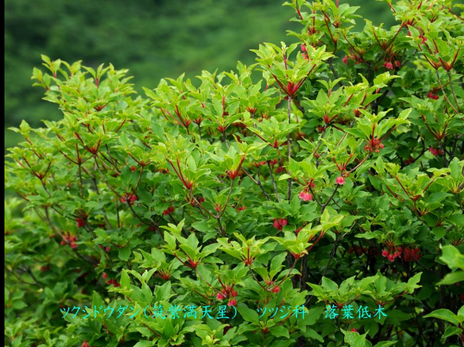
ツクドウダン(筑紫満天星) ツツジ科 落葉低木