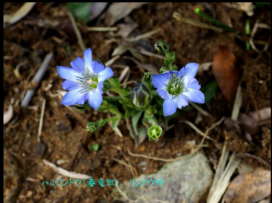
ハルリンドウ(春竜胆) リンドウ科