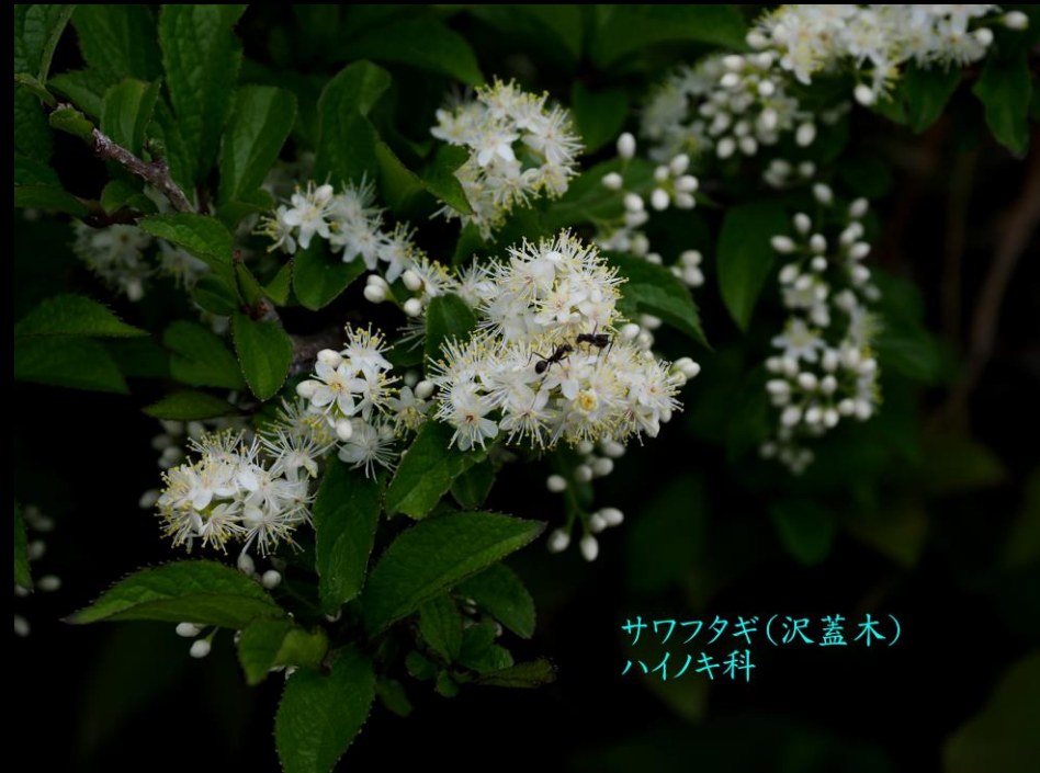
サワフタギ(沢蓋木) ハイノキ科