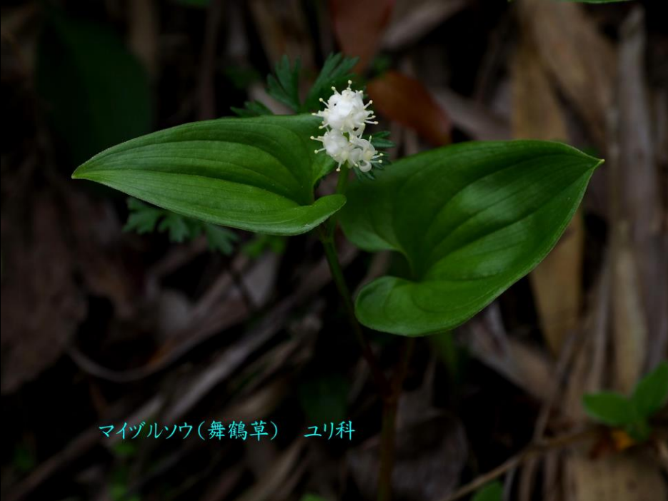
マイヅルソウ(舞鶴草) ユリ科