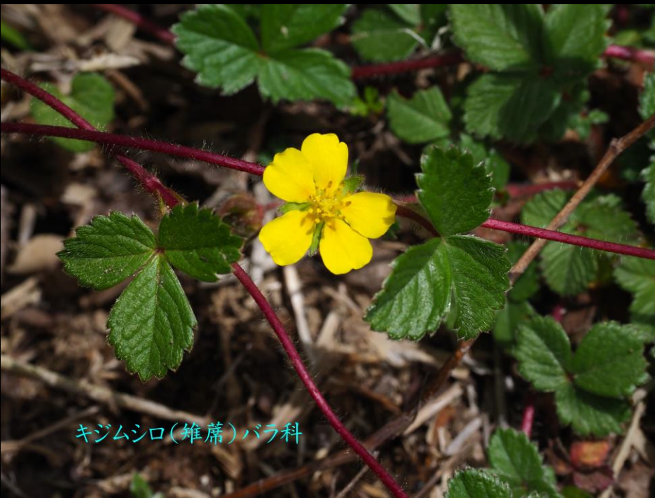
キジムシロ(雉薔)バラ科