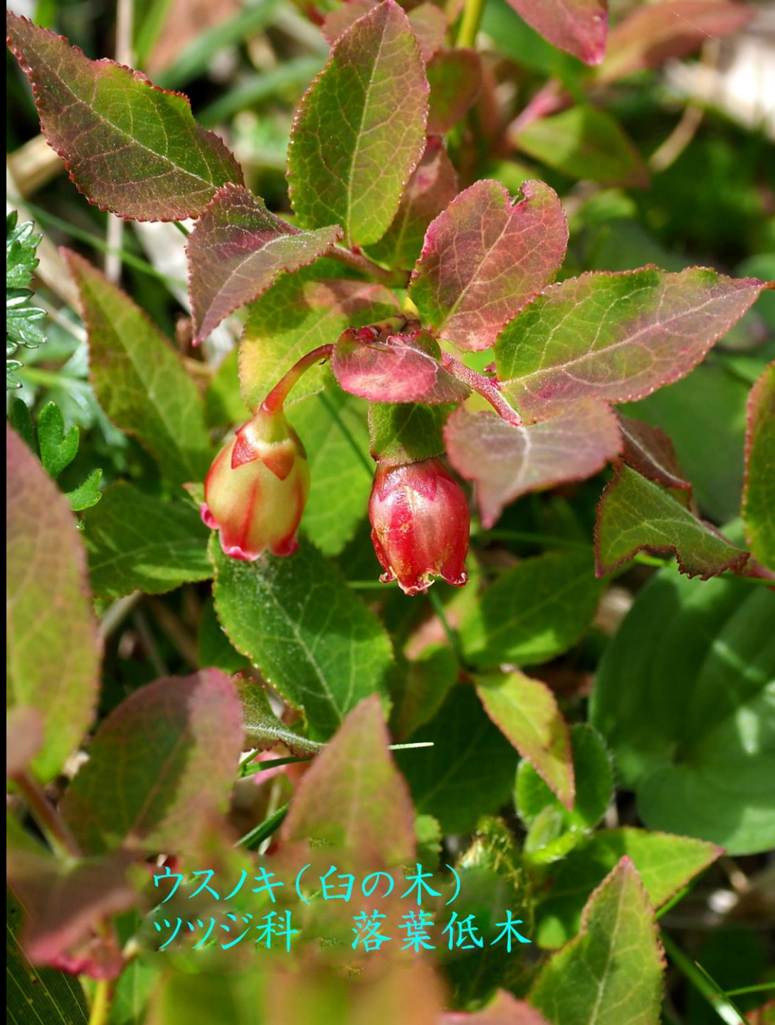
ウスノキ(白の木) ツツジ科 落葉低木