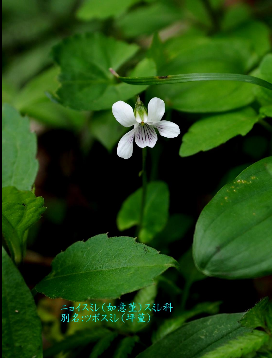
ニョイスミ(如意堇)スミ科 別名:ツボスミ(坪堇)