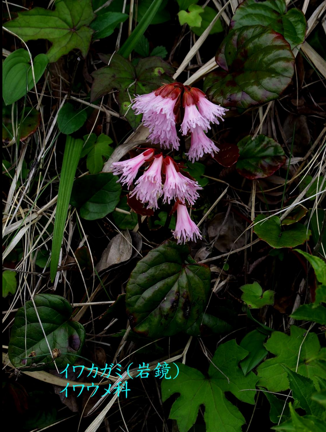
イワガミ(岩鏡) イワウメ科