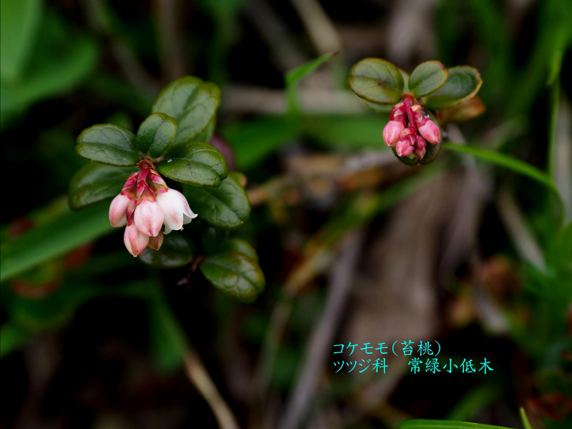
コケモモ(苔桃) ツツジ科 常緑小低木