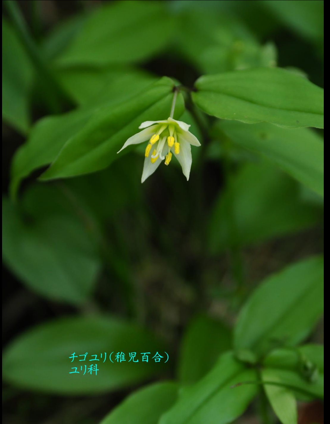
チゴユリ(稚児百合) ユリ科