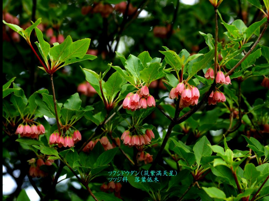
ツクシドウダン(筑紫満天星) ツツジ科 落葉低木