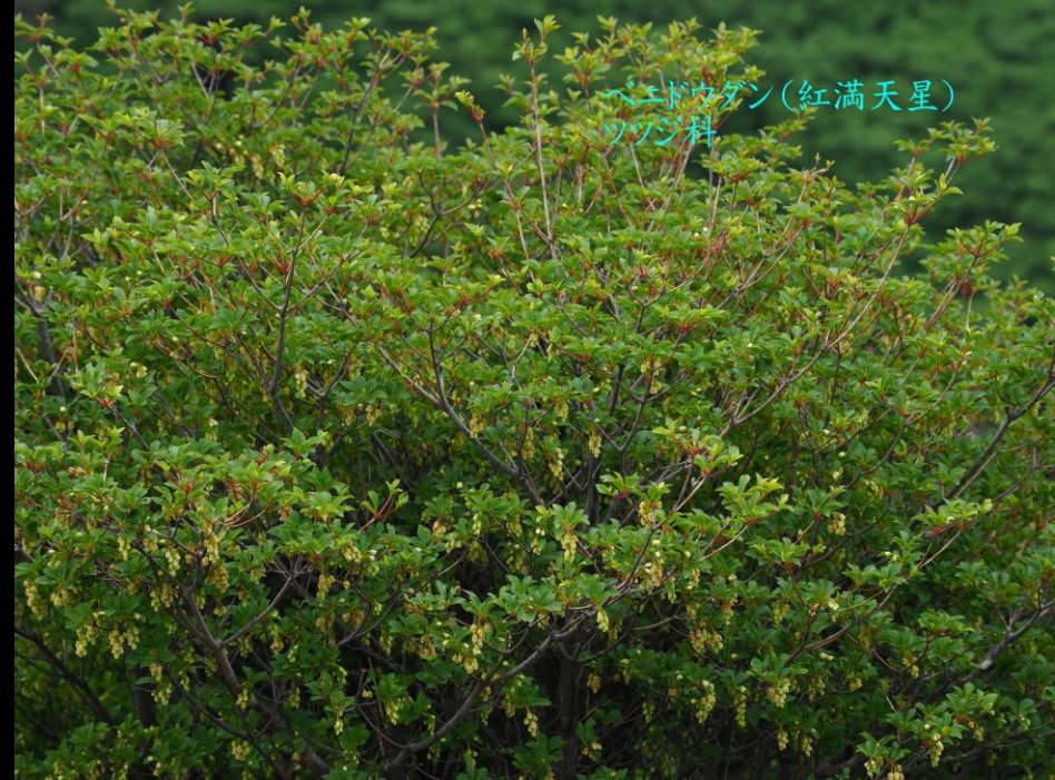
ベニドウダン(紅満天星) ツツジ科