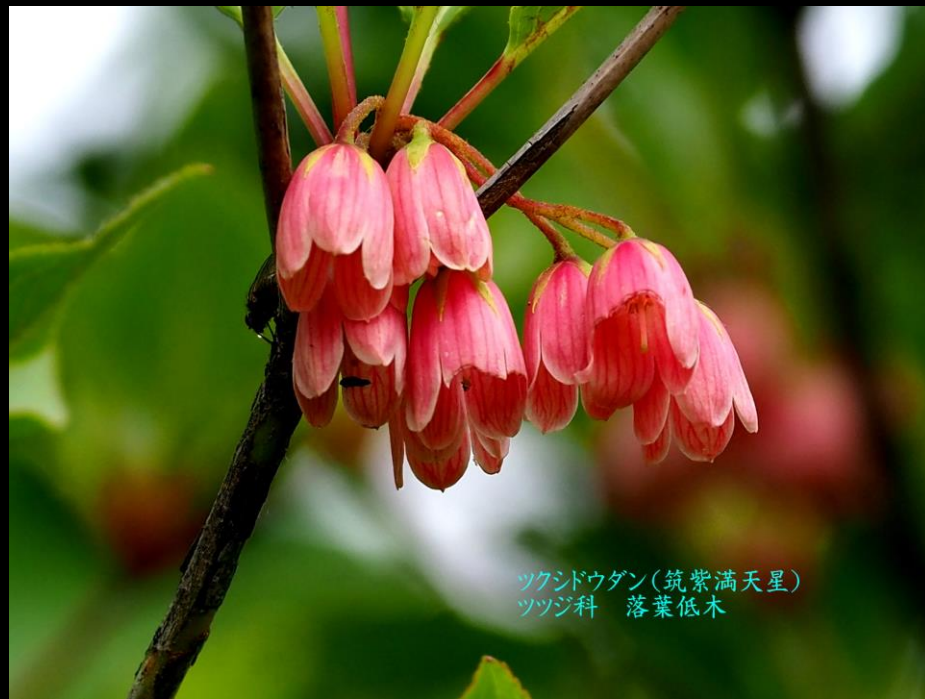
ツクシドウダン(筑紫満天星) ツツジ科 落葉低木