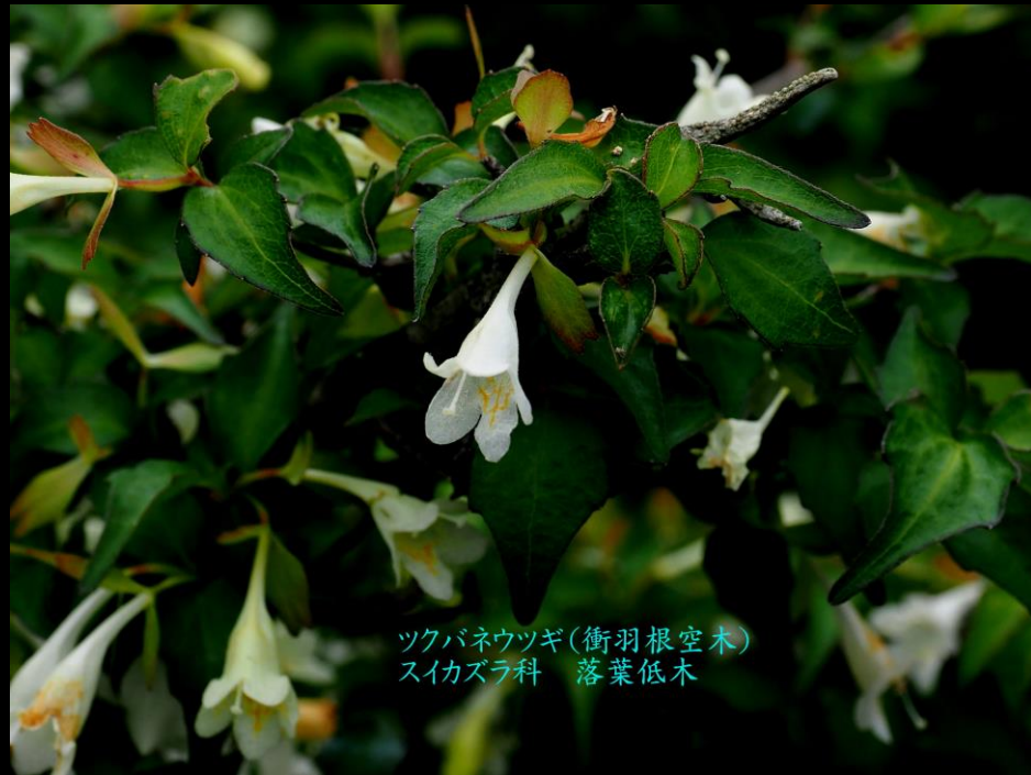
ツクバネウツギ(衝羽根空木) スイカズラ科 落葉低木