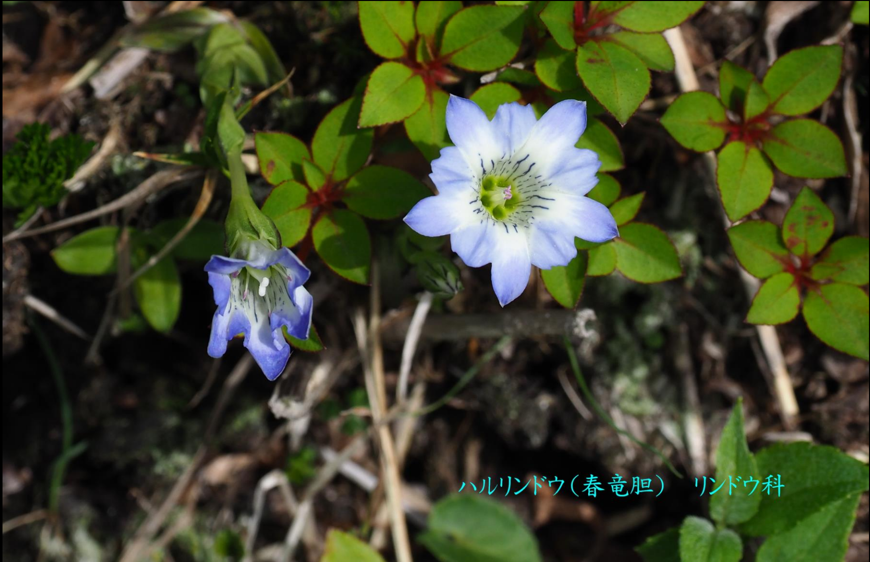
ハルリンドウ(春竜胆) リンドウ科