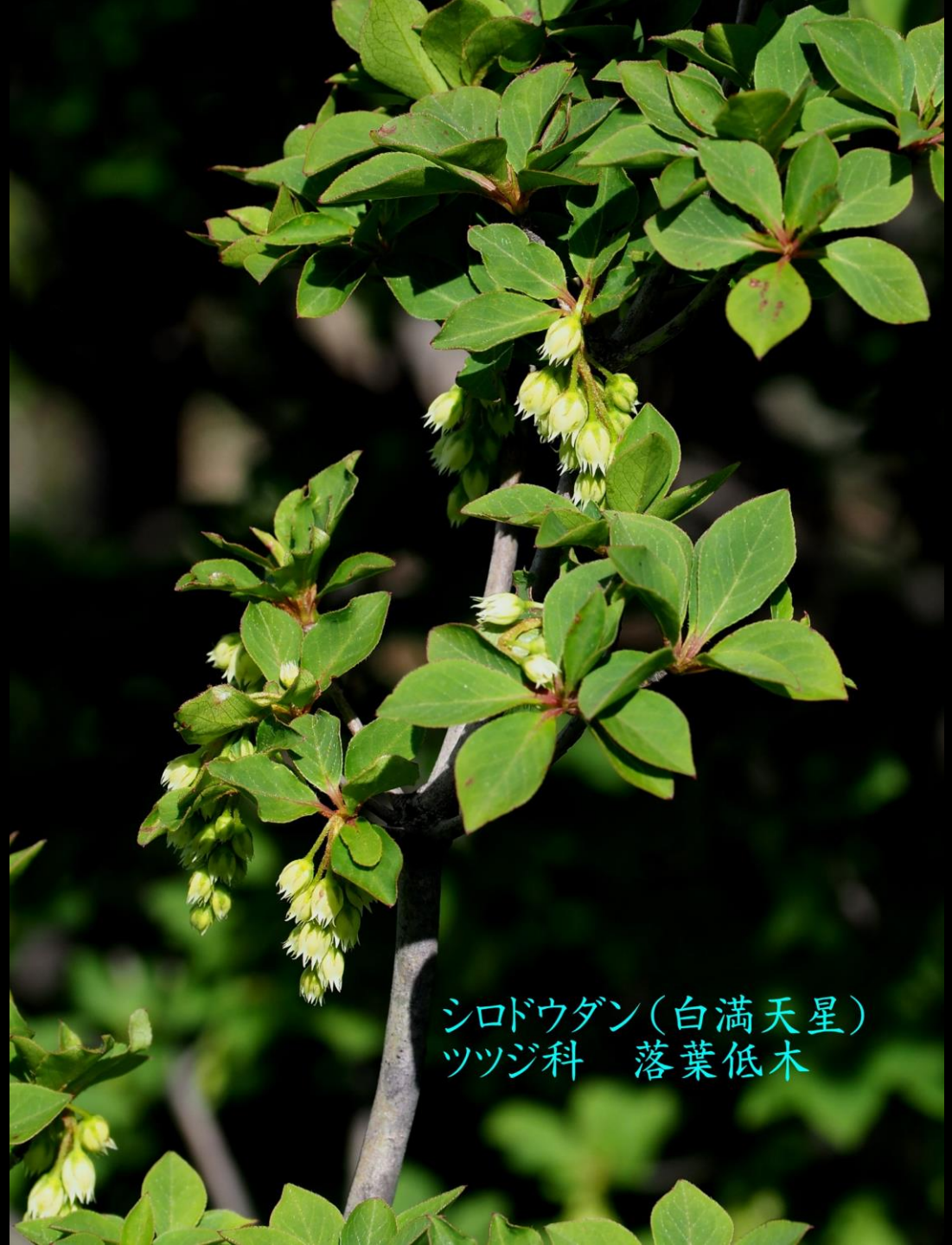
シロドウダン(白満天星) ツツジ科 落葉低木