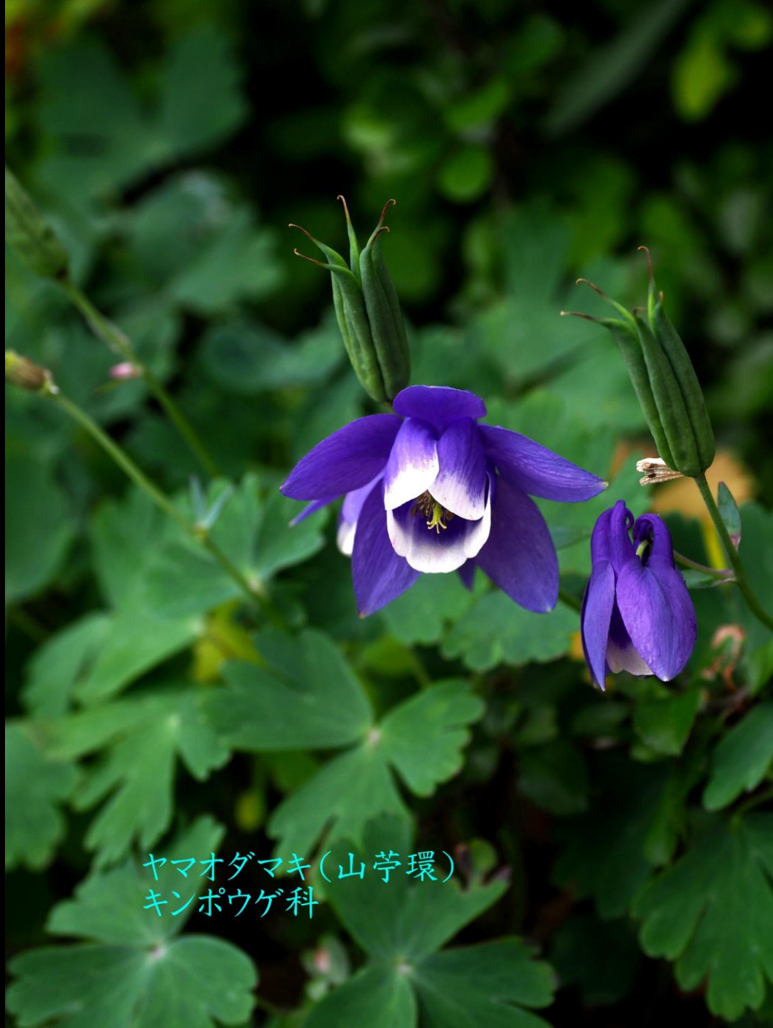
ヤマオダマキ(山苧環) キンポウゲ科