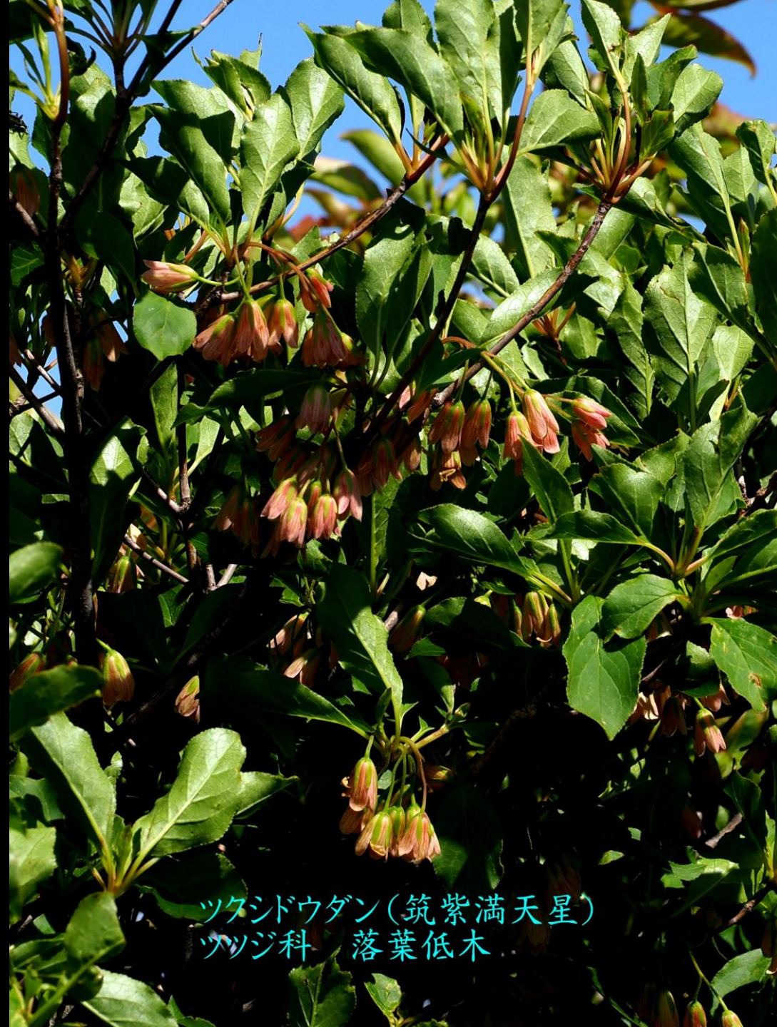
ツクシドウダン(筑紫満天星) ツツジ科 落葉低木