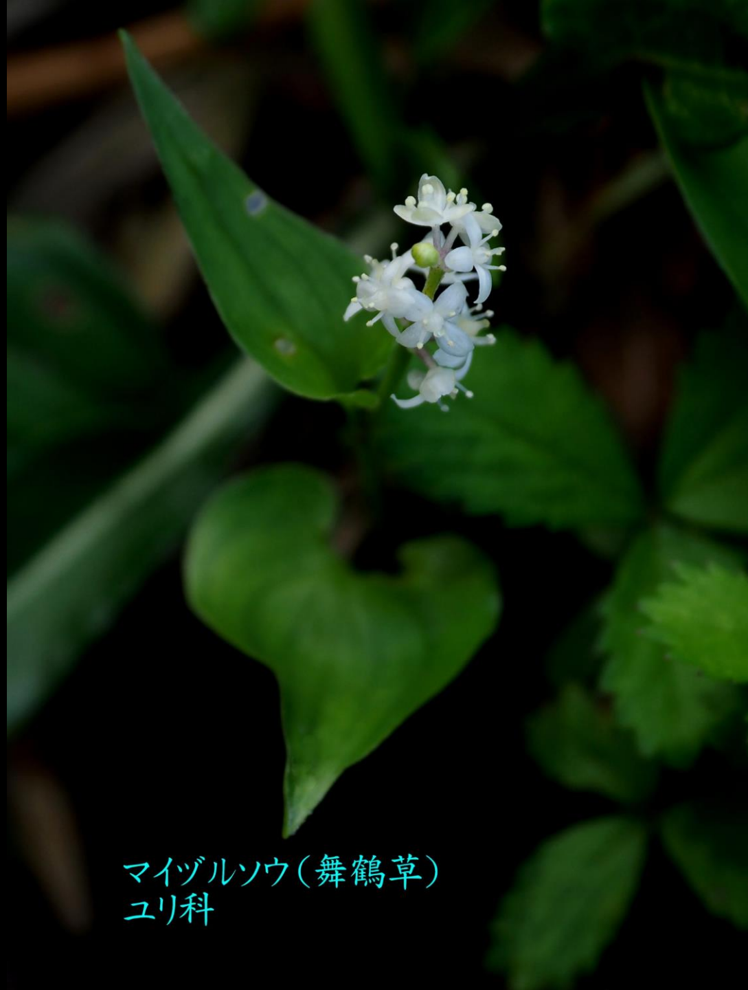
マイヅルソウ(舞鶴草) ユリ科