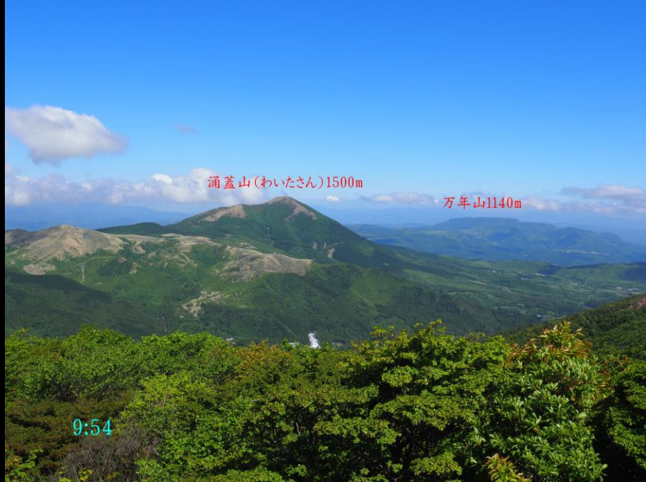
涌蓋山(わいたさん)1500m