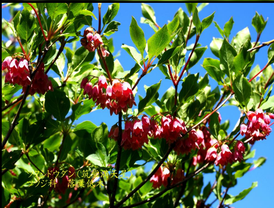
ツクシドウダン(筑紫満天星) ツツジ科 落葉低木