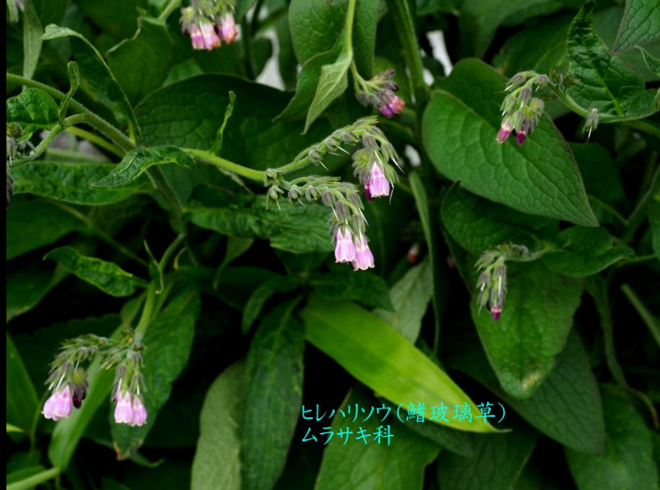
ヒレハリソウ(鱒玻璃草) ムラサキ科