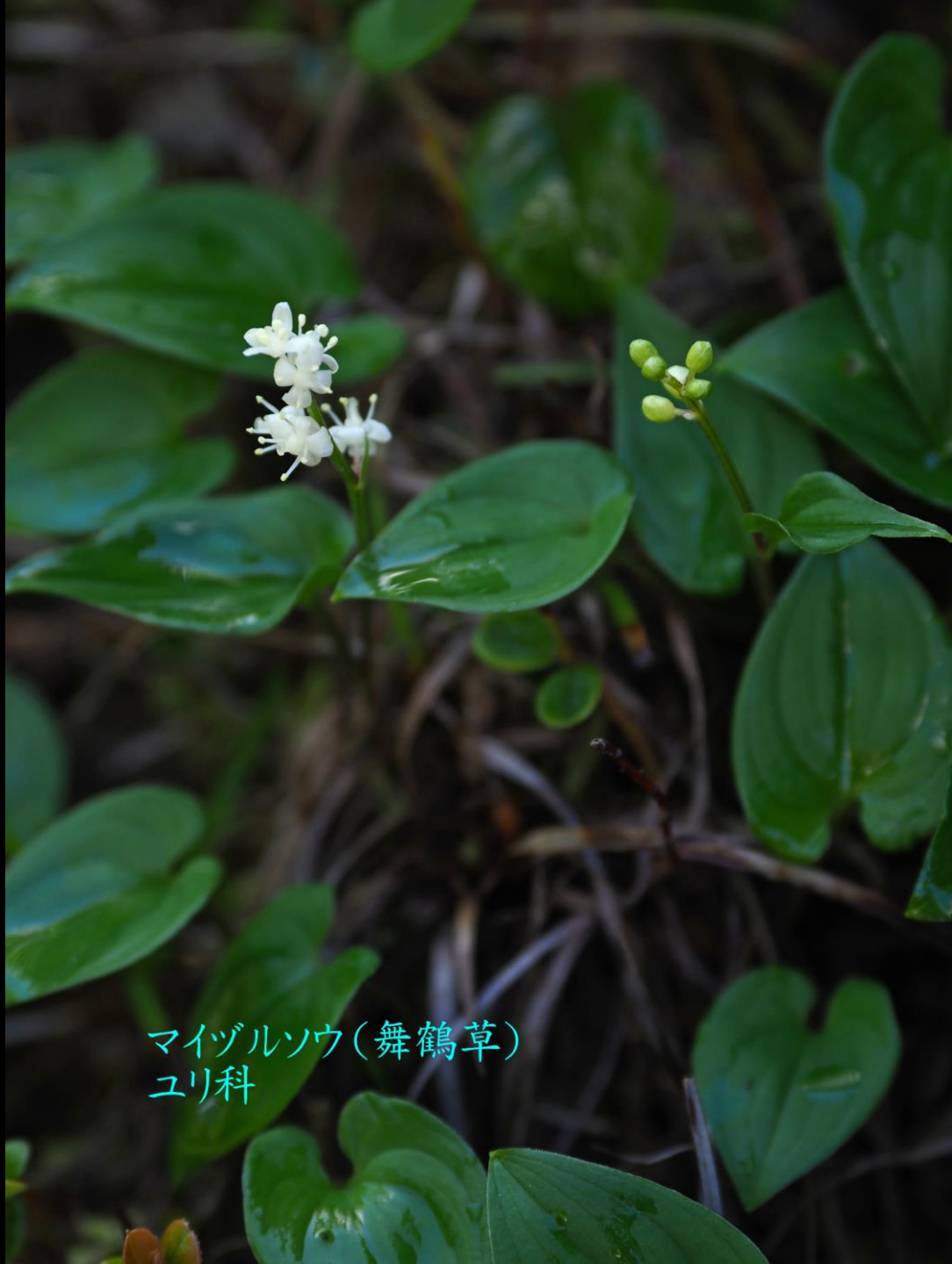
マイヅルソウ(舞鶴草) ユリ科