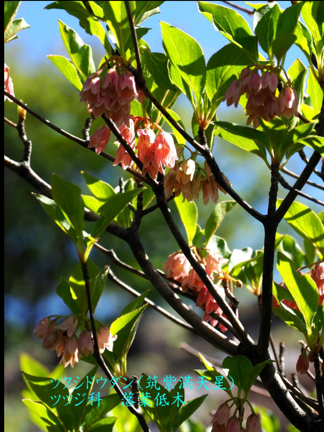
ツクシドウダン(筑紫満天星) ツツジ科 落葉低木