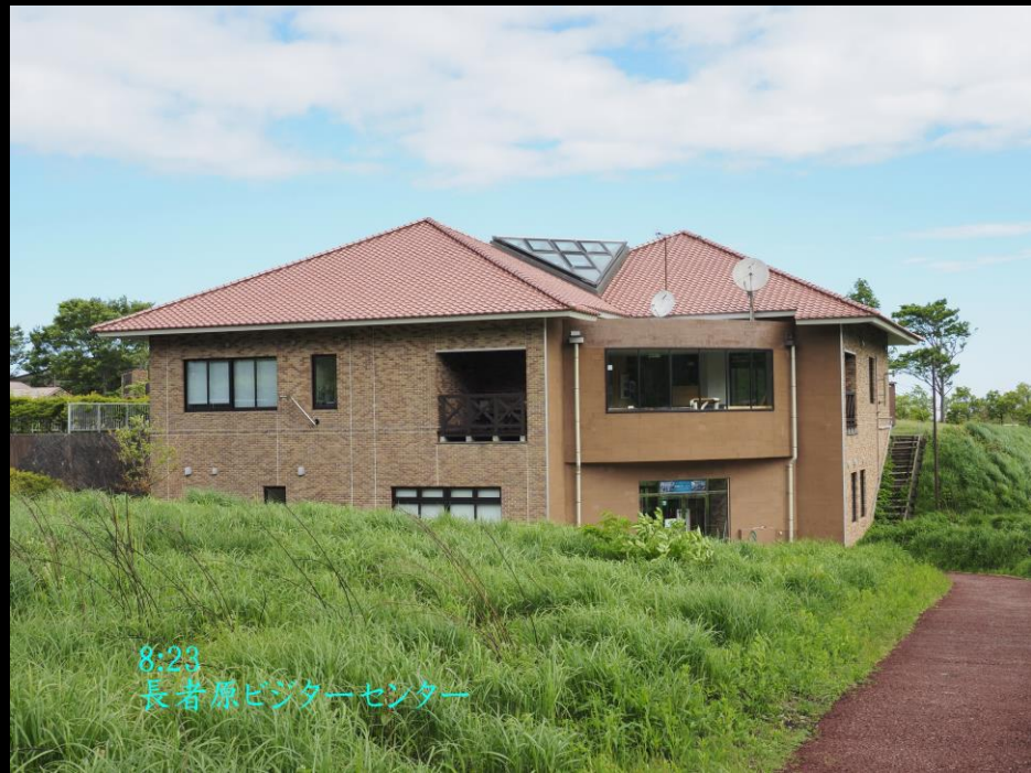
8:23 長者原ビジターセンター