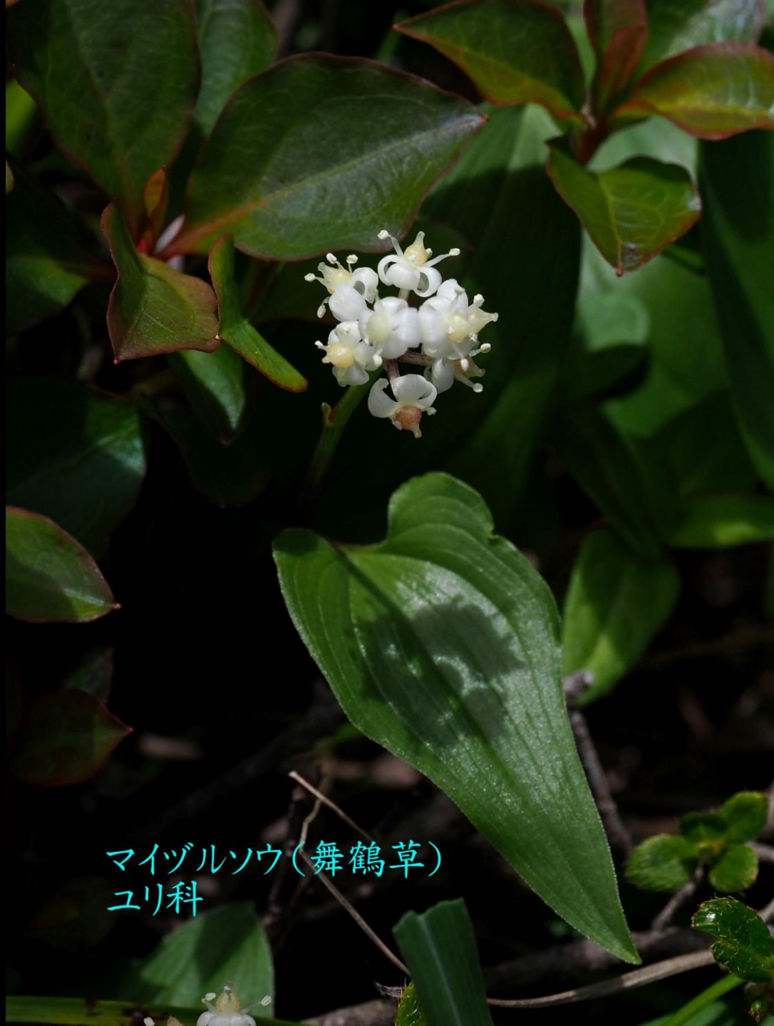
マイヅルソウ(舞鶴草) ユリ科