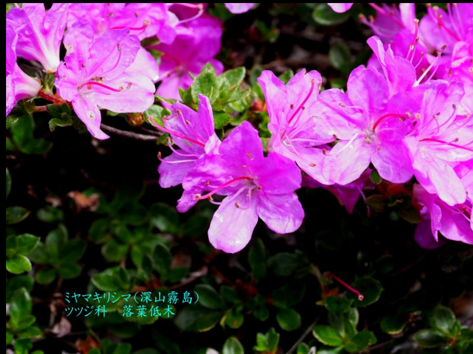
ミヤマキリシマ(深山霧島) ツツジ科 落葉低木