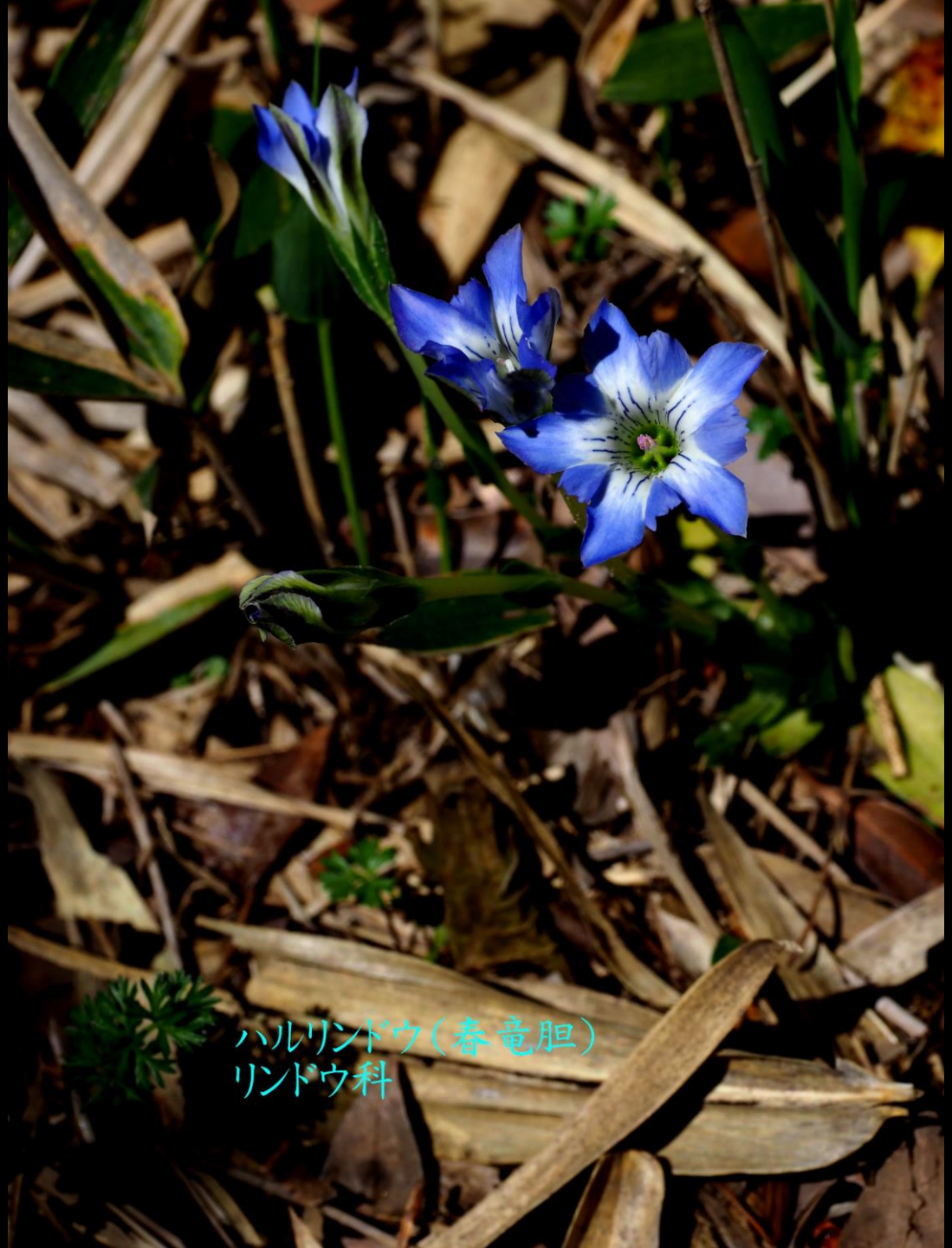
ハルリンドウ(春竜胆) リンドウ科