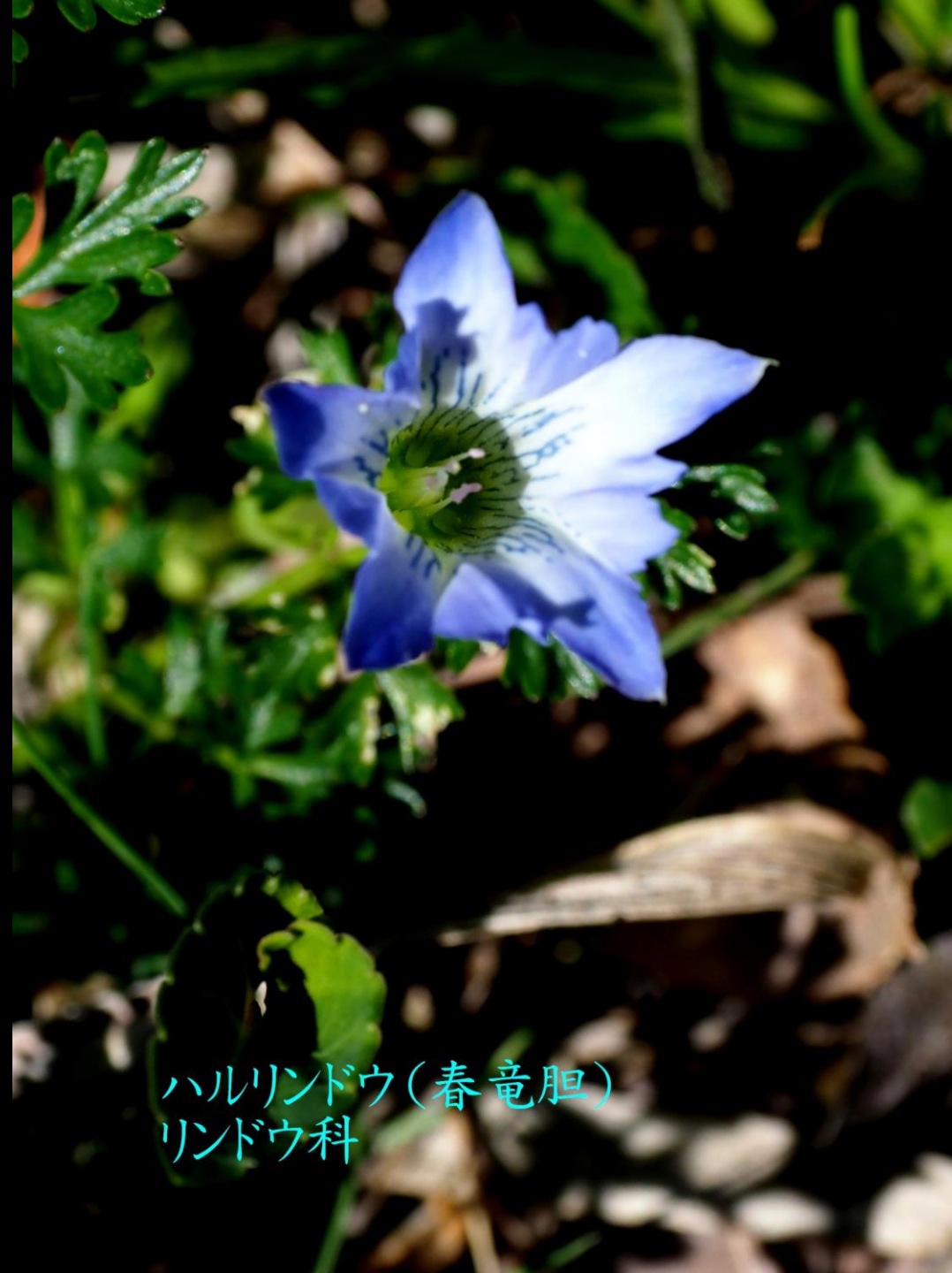
ハルリンドウ(春竜胆) リンドウ科