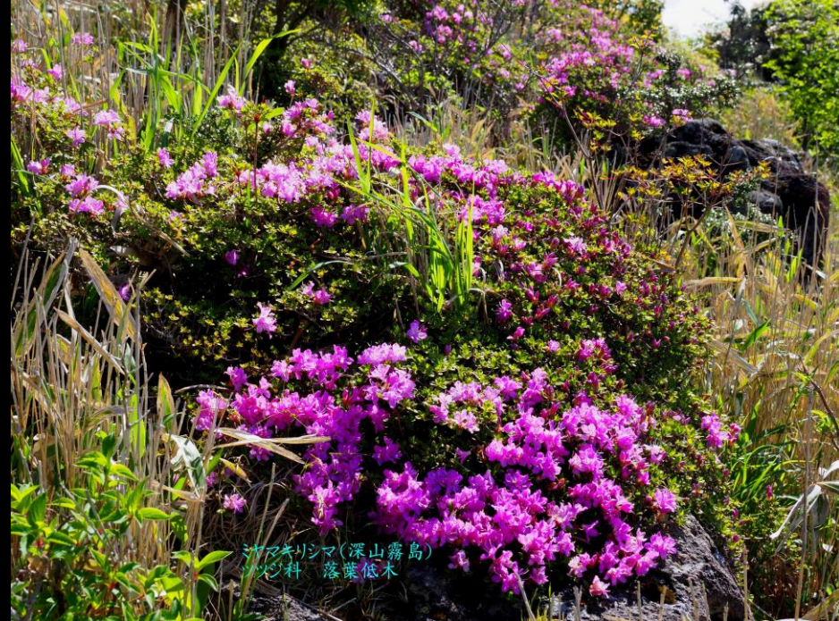
ミヤマキリシマ(深山霧島) ツツジ科 落葉低木