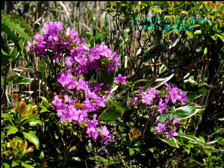
ミヤマキリシマ(深山霧島) ツツジ科 落葉低木