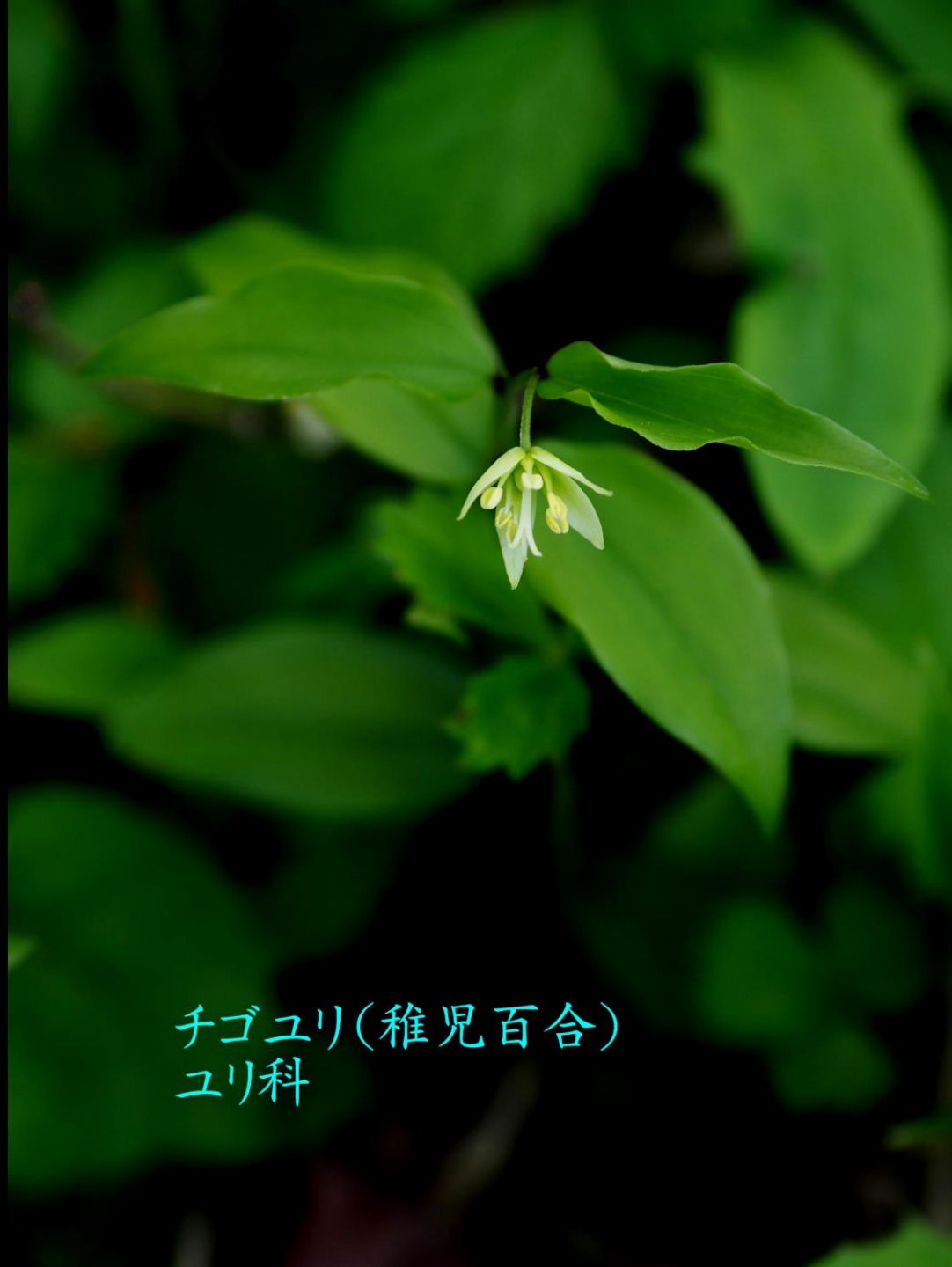
チゴユリ(稚児百合) ユリ科