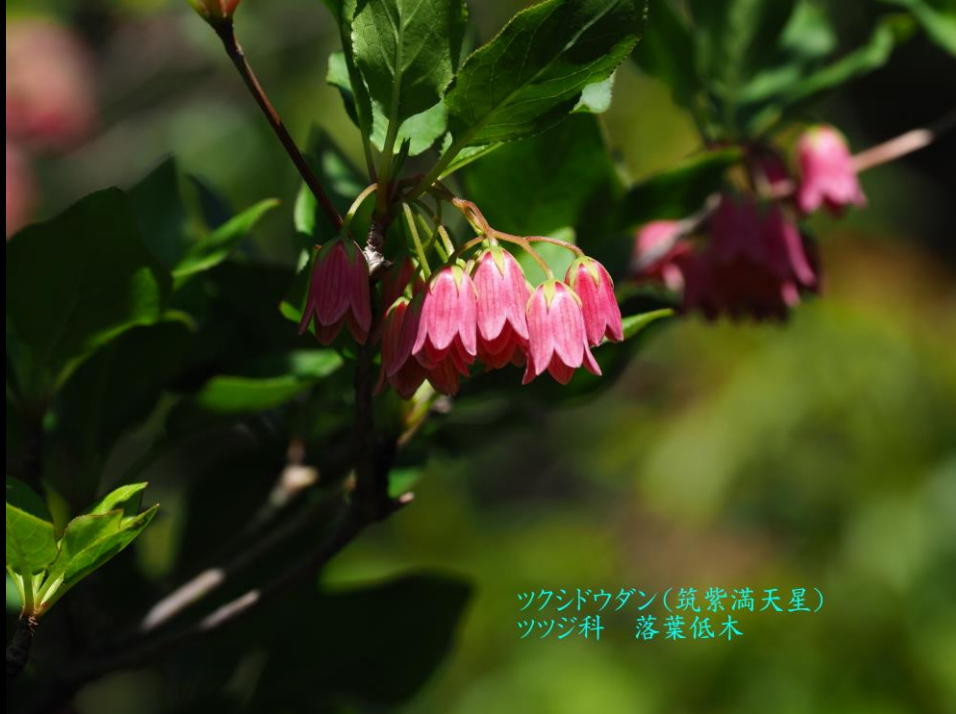
ツクシドウダン(筑紫満天星) ツツジ科 落葉低木