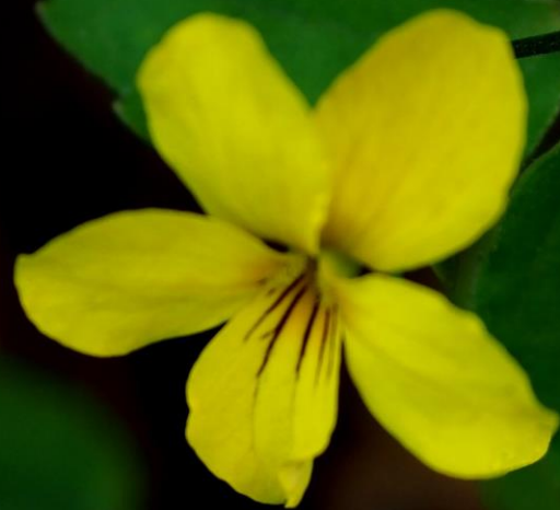
キスミ(黄堇) スミ科