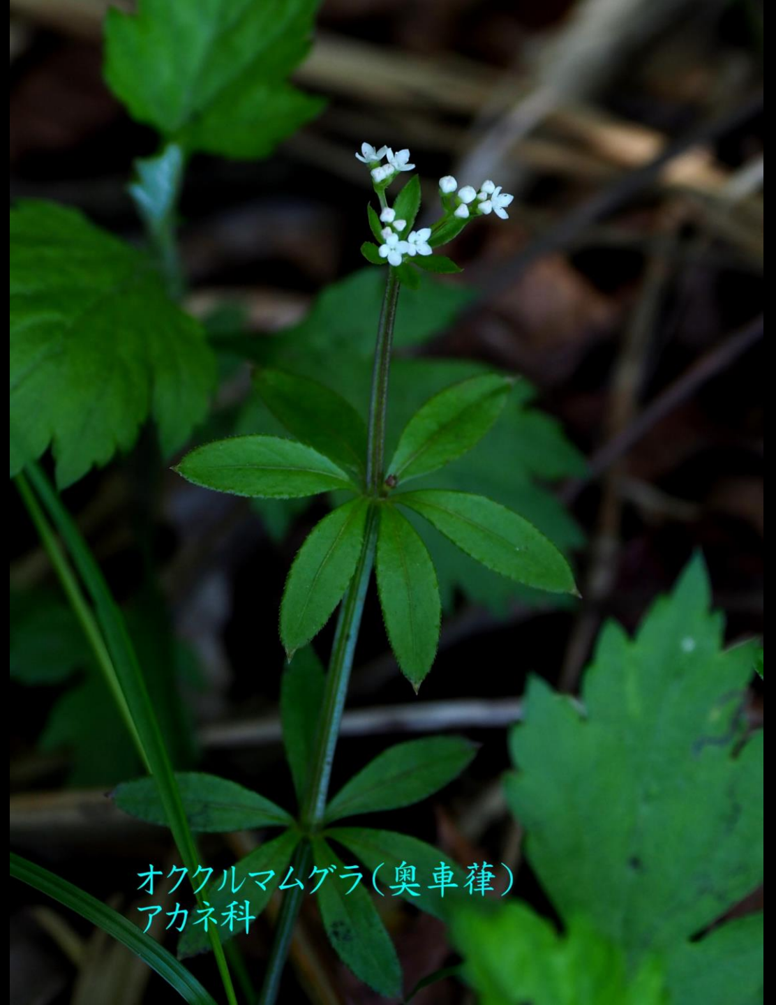
オククルマムゲラ(奥車蔘) アカネ科