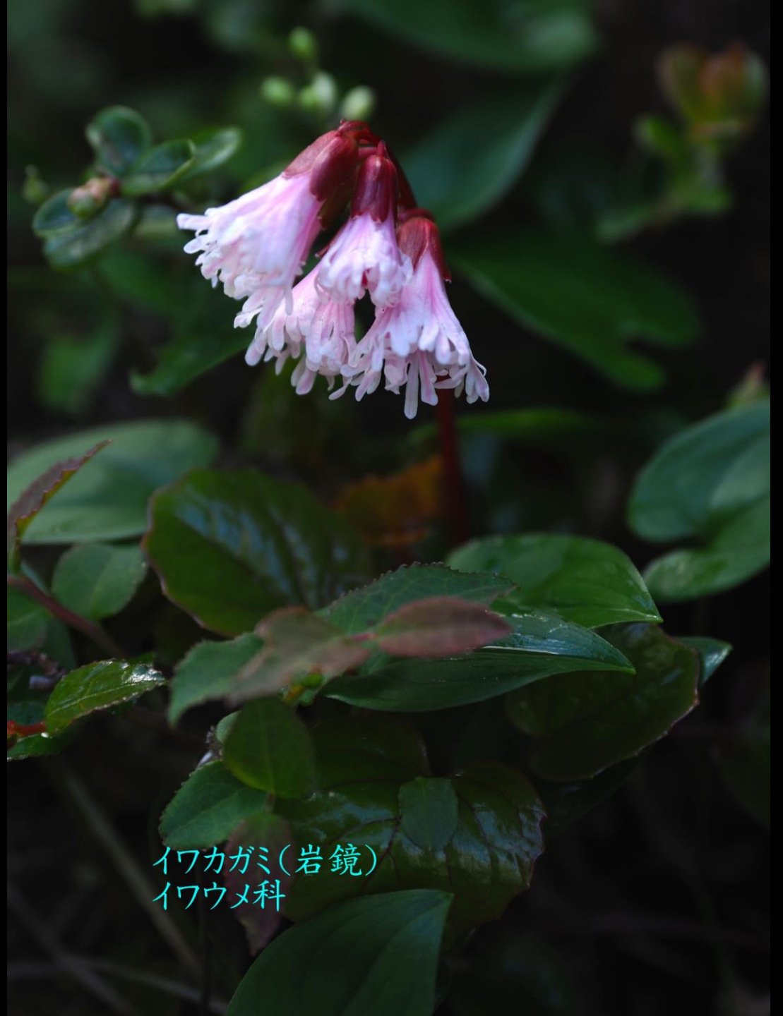
イワカガミ(岩鏡) イワウメ科