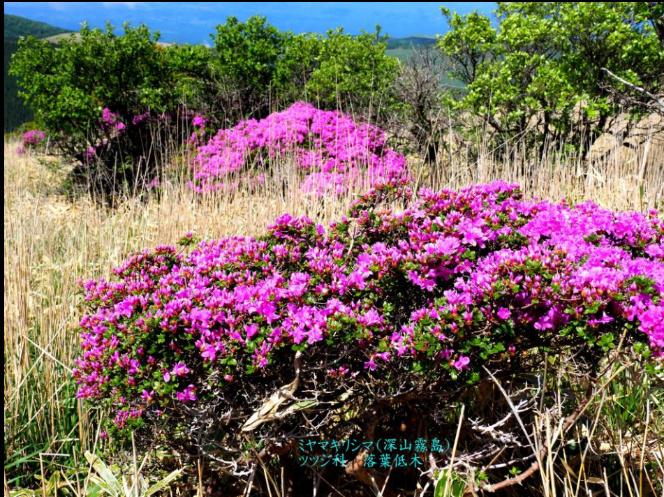
ミヤマギンマ(深山霧島) ツツジ科 落葉低木