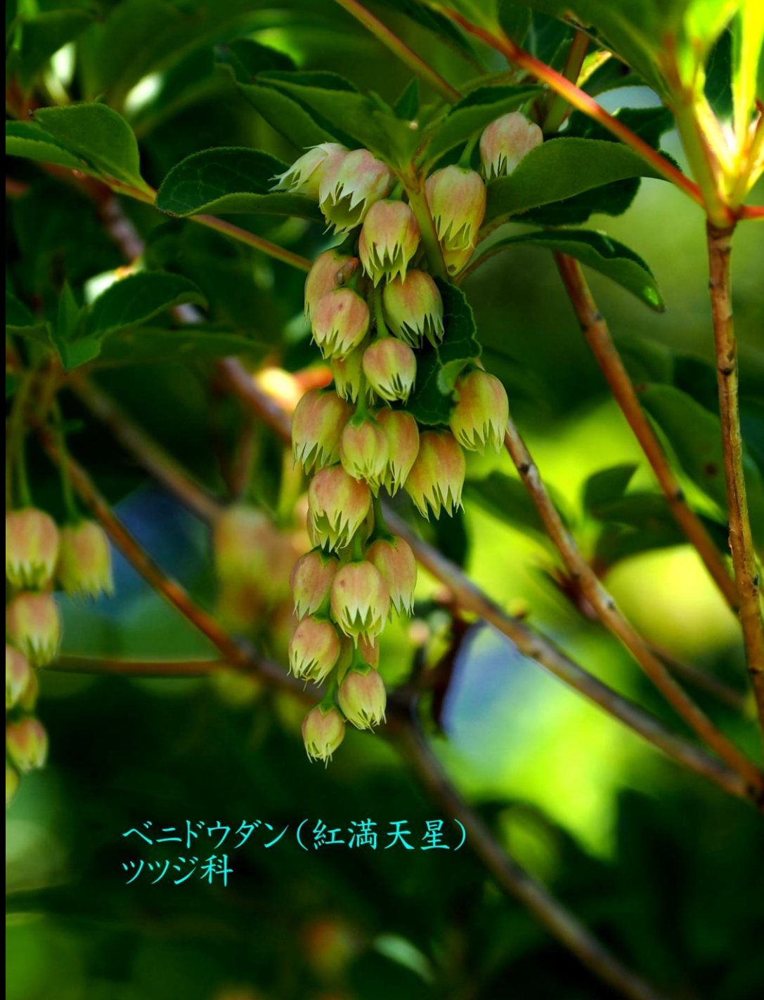
ベニドウダン(紅満天星) ツツジ科