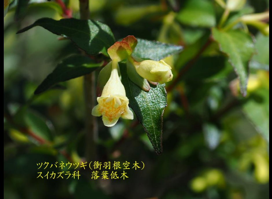
ツクバネウツギ(衝羽根空木) スイカズラ科 落葉低木