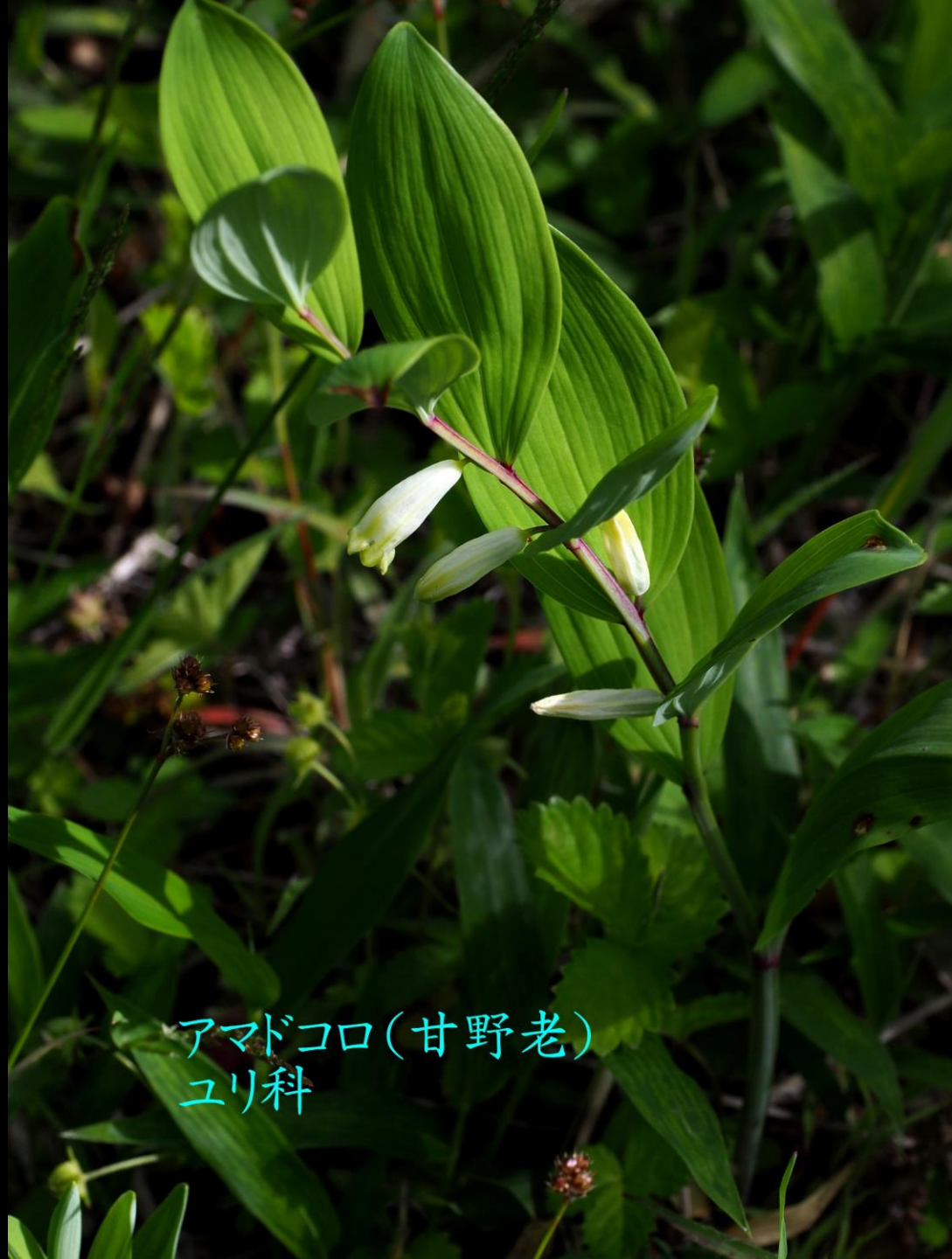
アマドコロ(甘野老) ユリ科