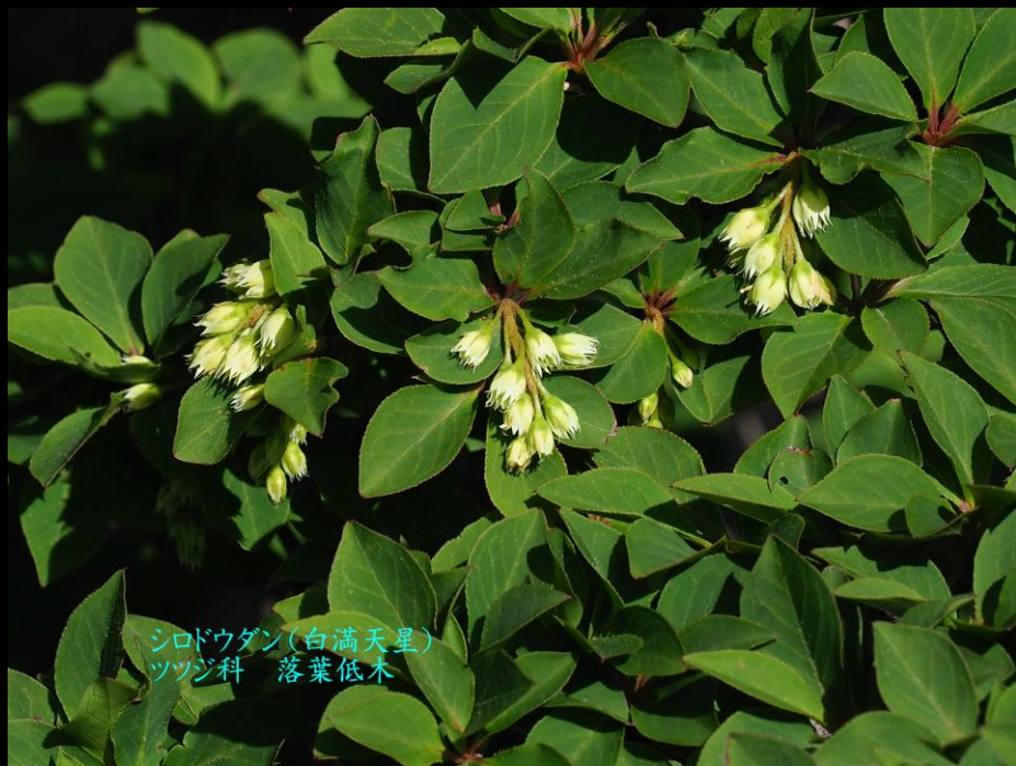
シロドウダン(白満天星) ツツジ科 落葉低木