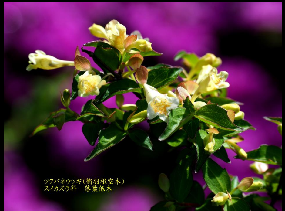
ツクバネウツギ(衝羽根空木) スイカズラ科 落葉低木