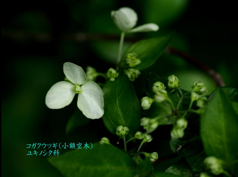
コガクウツギ(小額空木) ユキノタ科