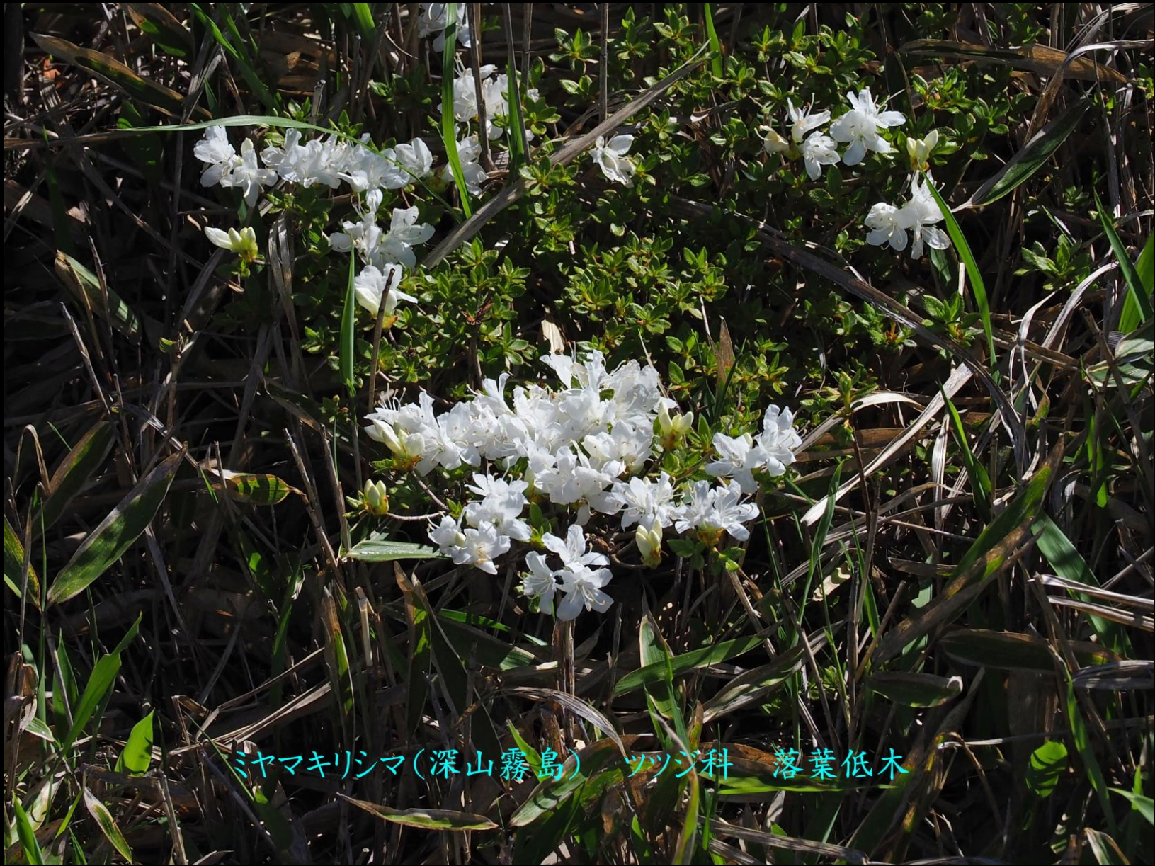
ミヤマキリシマ(深山霧島) ツツジ科 落葉低木