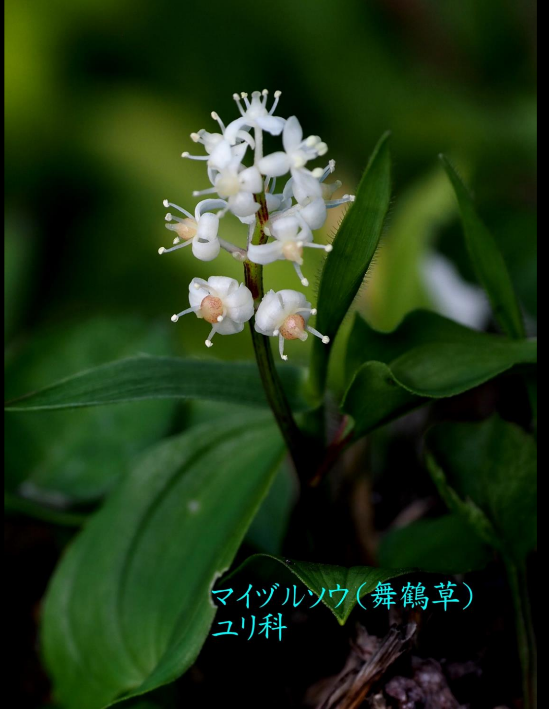
マイヅルソウ(舞鶴草) ユリ科