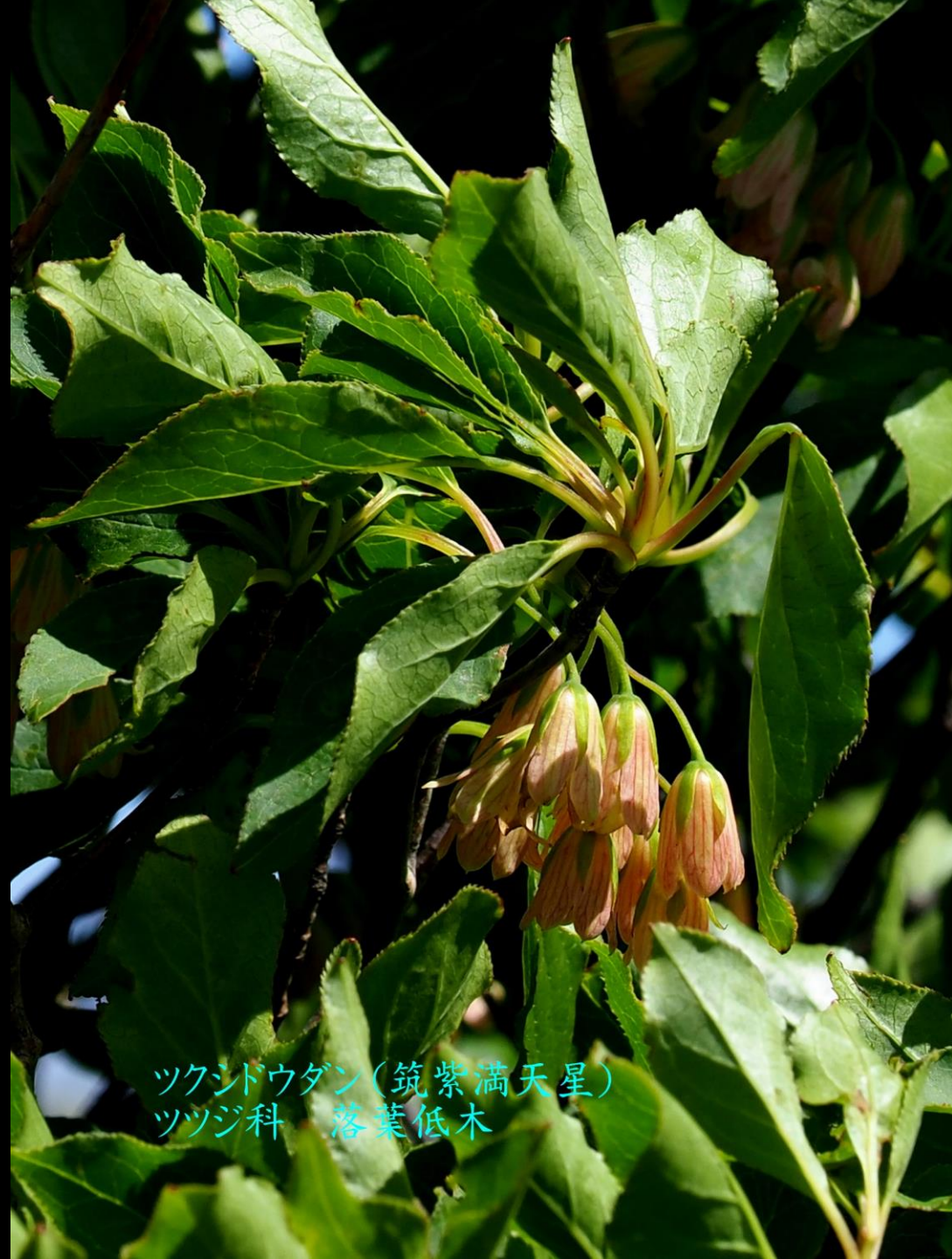
ツクシドウダン(筑紫満天星) ツツジ科 落葉低木