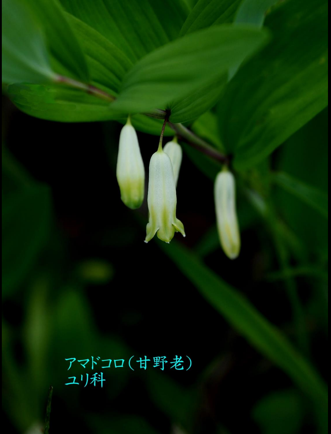
アマドコロ(甘野老) ユリ科