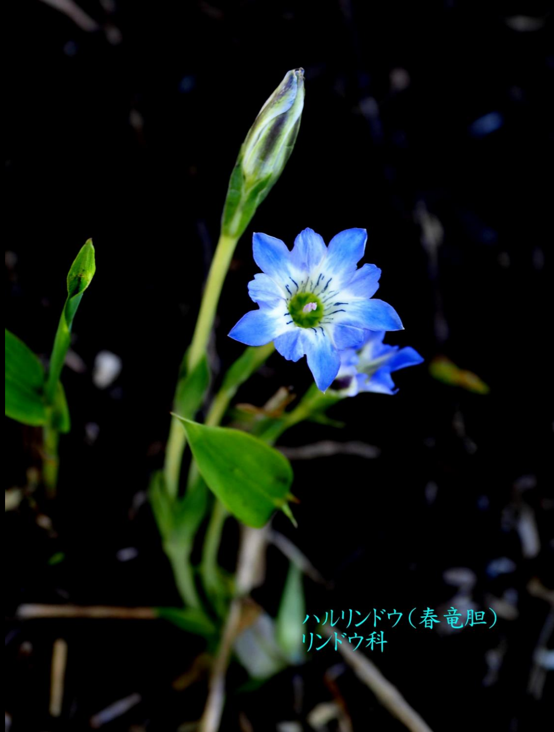
ハルリンドウ(春竜胆) リンドウ科