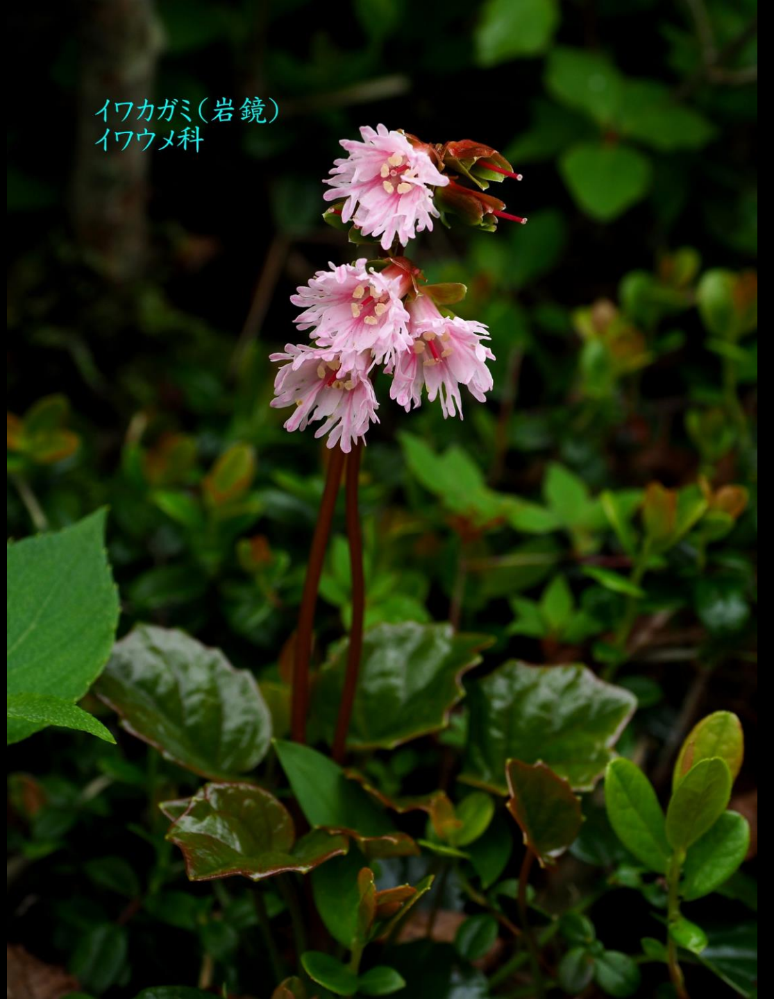
イワカガミ(岩鏡) イワウメ科