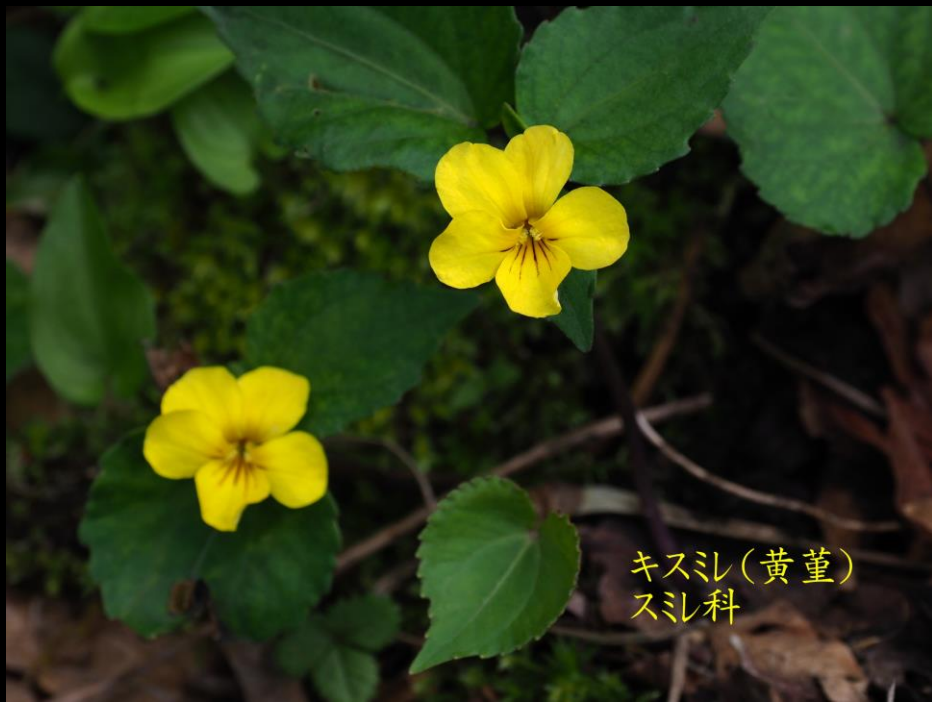
キスミ(黄堇) スミ科