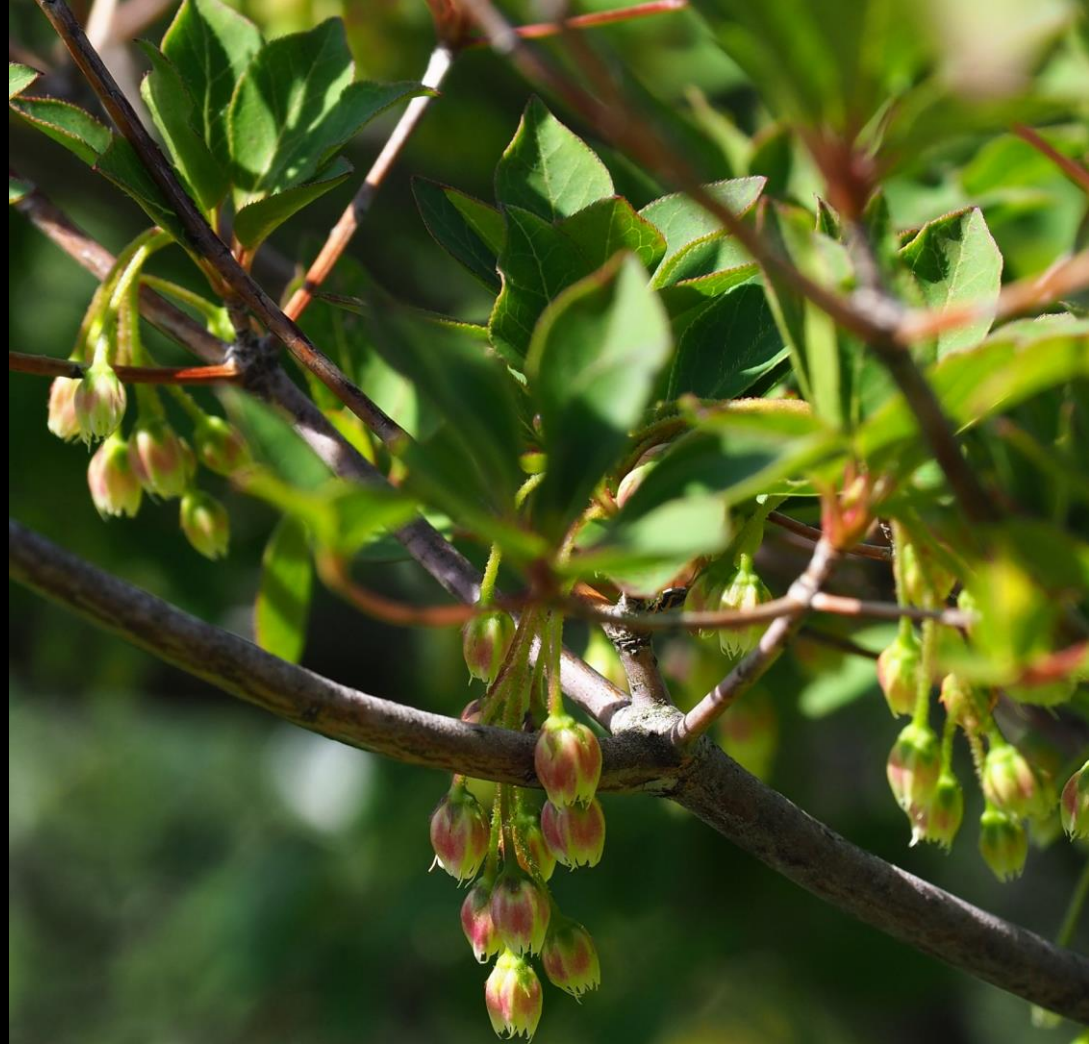
ベニドウダン(紅満天星) ツツジ科