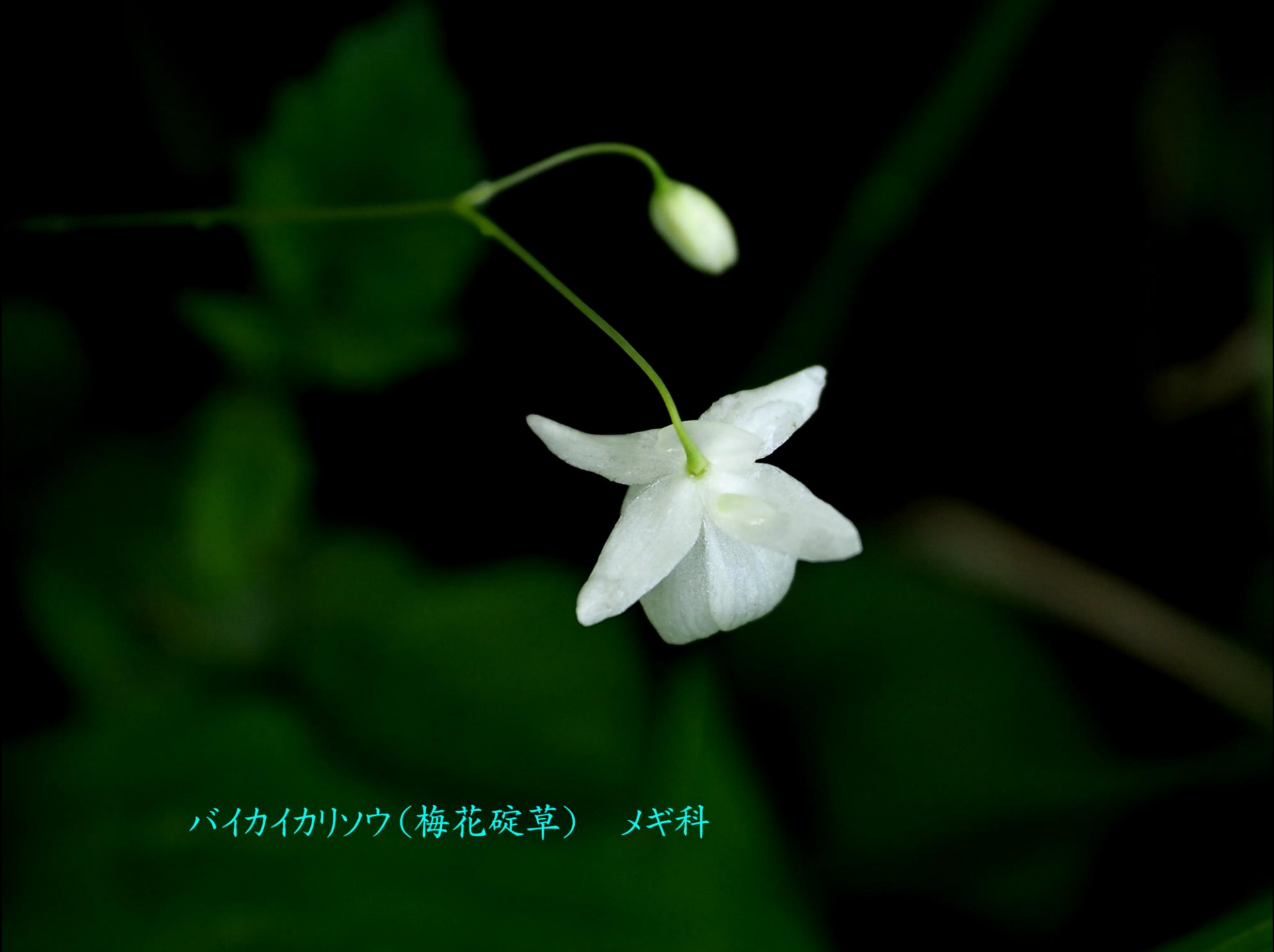
バイカイソウ(梅花碇草) メギ科