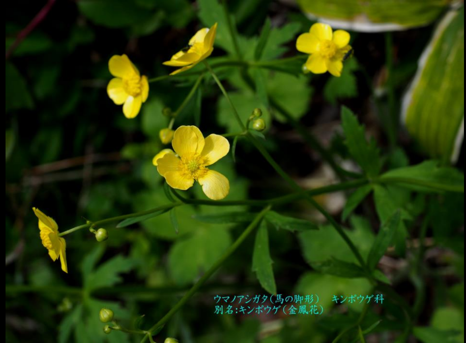
ウmanoアシガタ(馬の脚形) キンポウゲ科 別名:キンポウゲ(金鳳花)