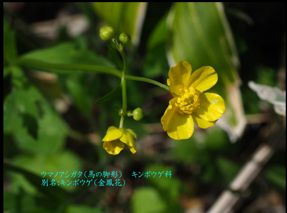
ウmanoアシガタ(馬の脚形) キンポウゲ科 別名:キンポウゲ(金鳳花)