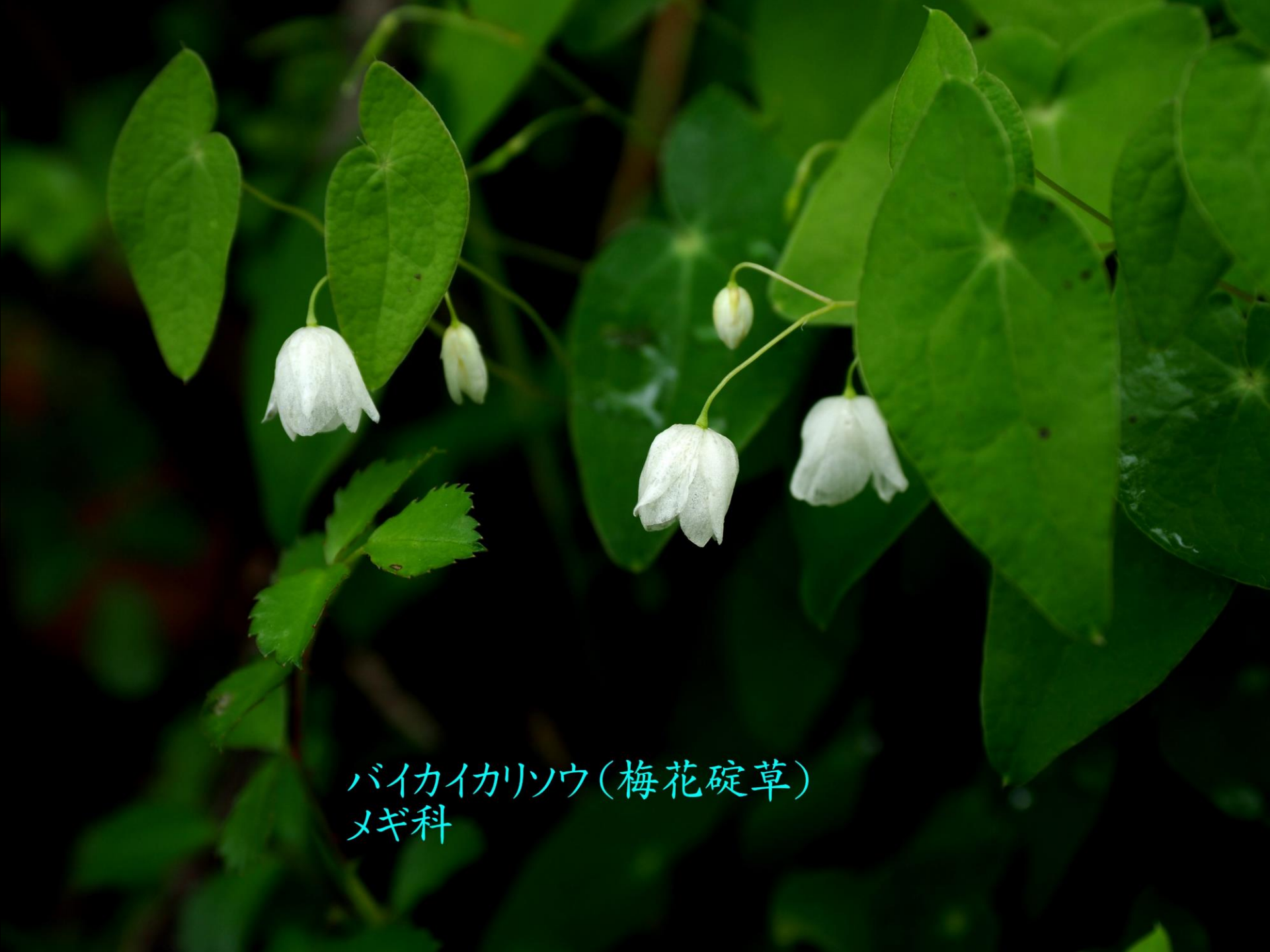
バイカイカソウ(梅花碇草) メギ科