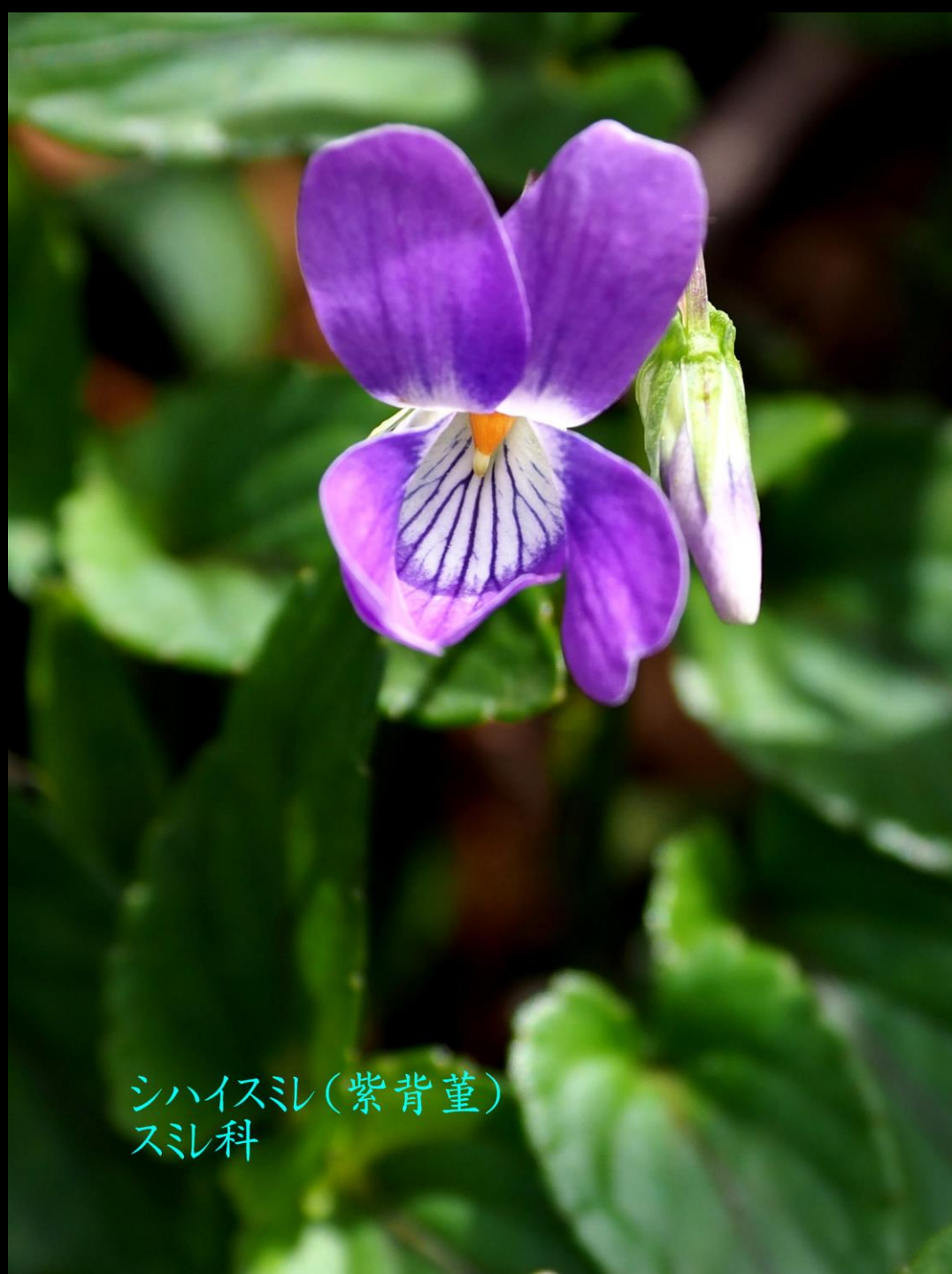
シハイスミ(紫背堇) スミ科