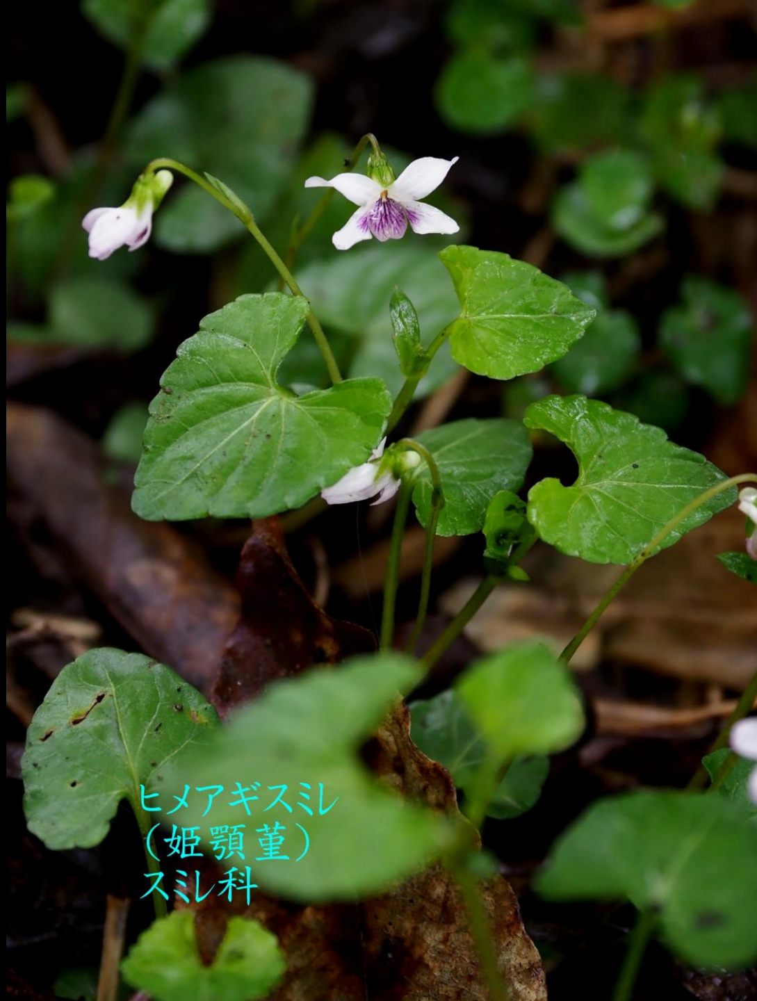
ヒメアギスミ (姫顎堇) スミ科