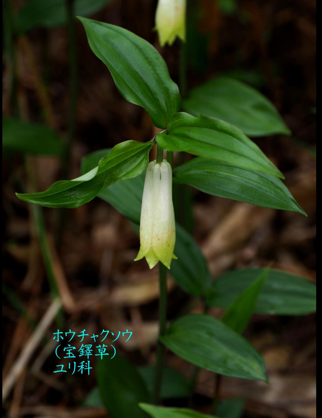
ホウチャクソウ (宝鐸草) ユリ科