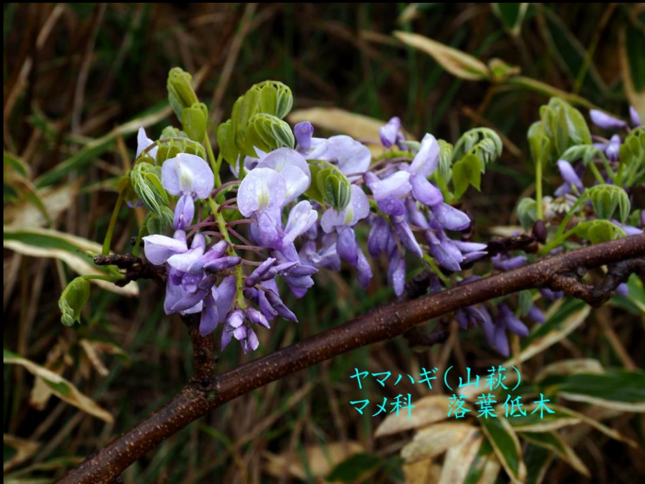
ヤマハギ(山萩) マメ科 落葉低木