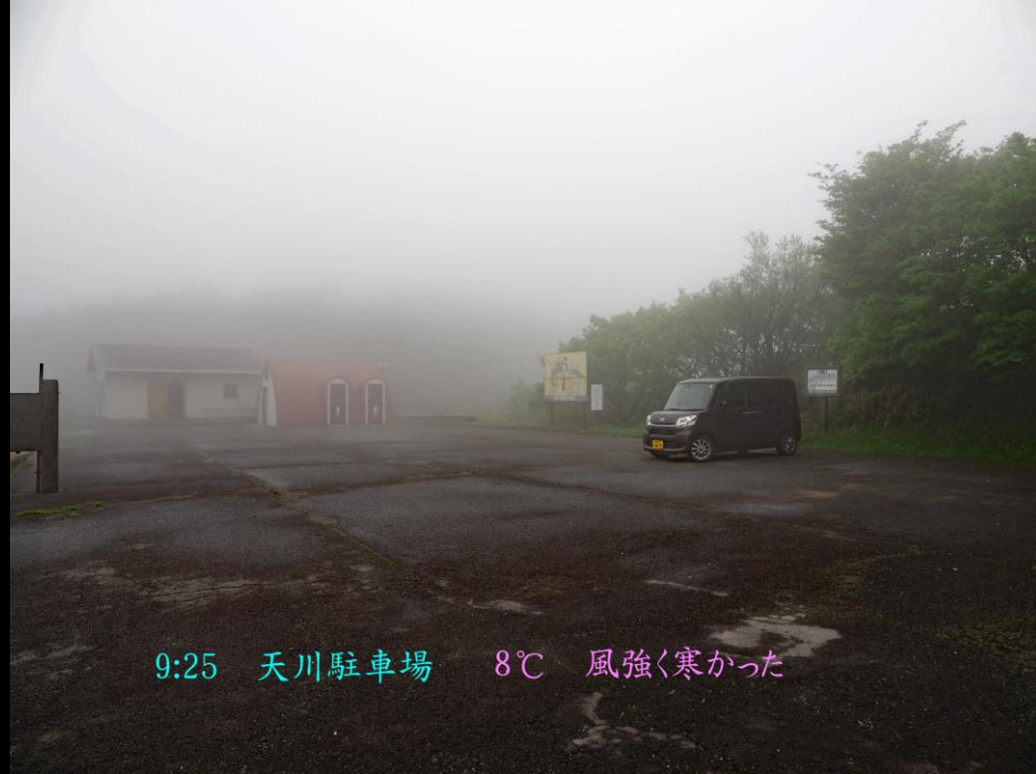
9:25 天川駐車場 8℃ 風強く寒かった