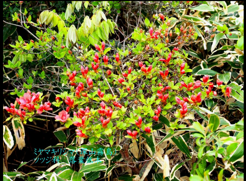
ミヤマキリシマ(深山霧島) ツツジ科 落葉低木