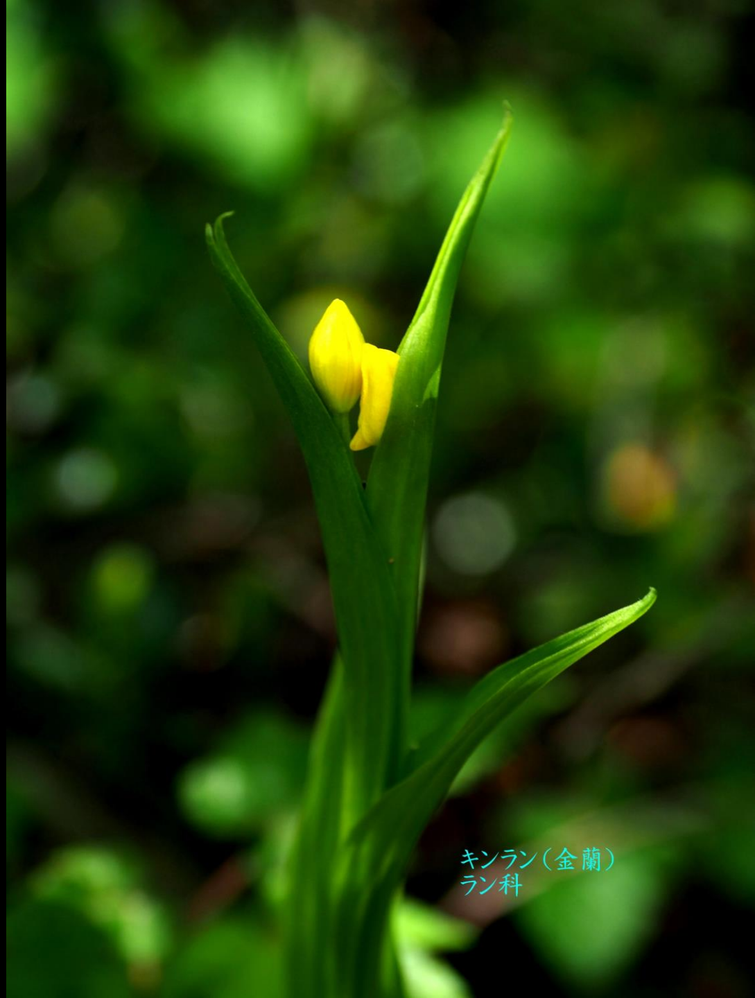
キンラン(金蘭) ラン科