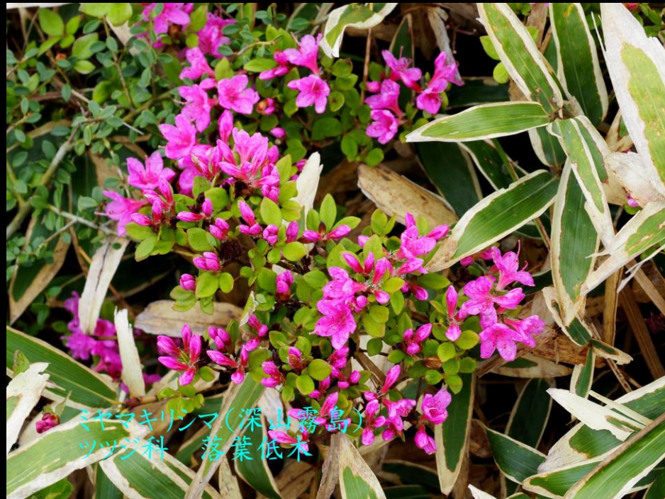
ヤマキリシマ(深山霧島) ツツジ科 落葉低木