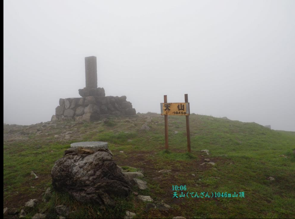
10:06 天山(てんざん)1046m山頂