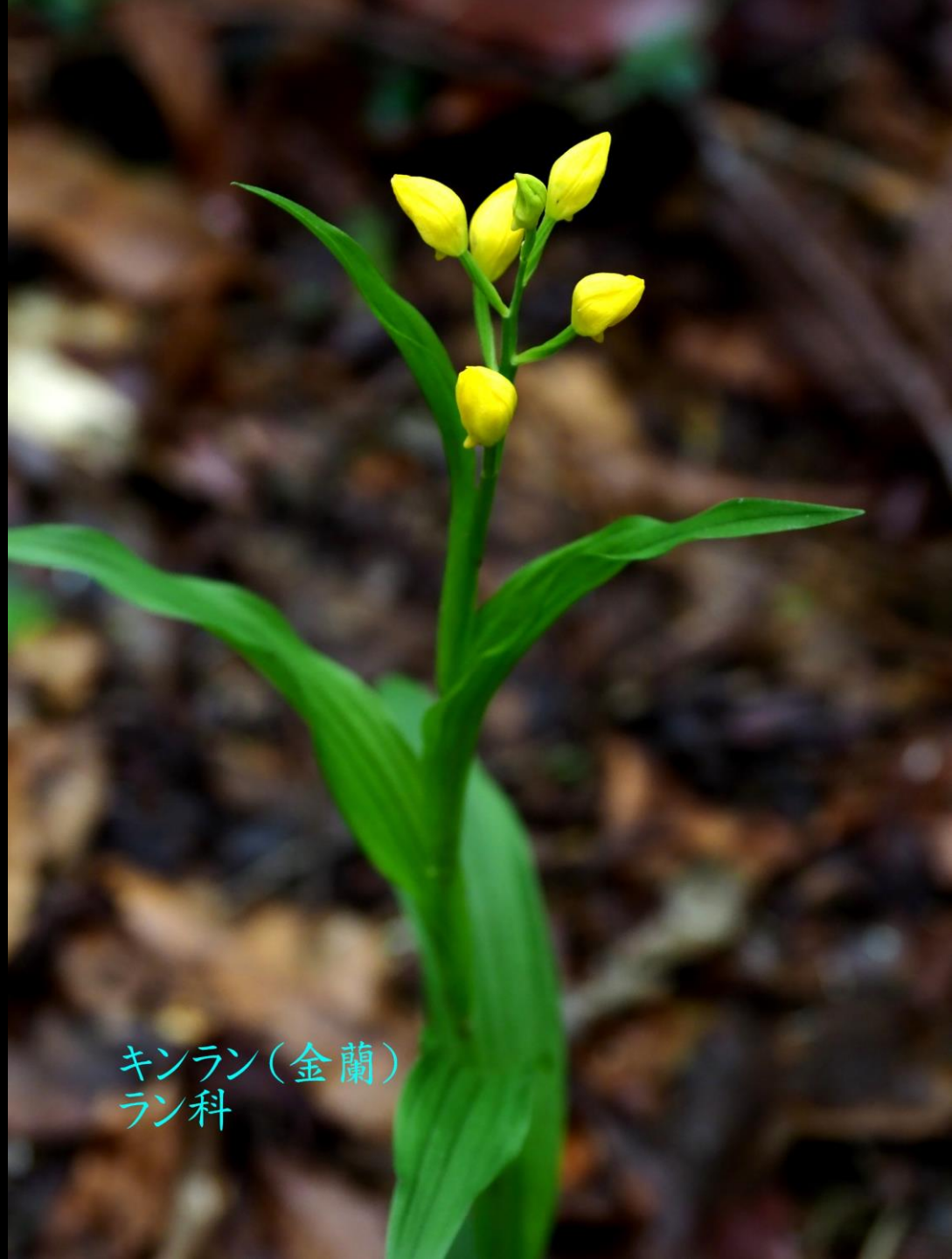
キンラン(金蘭) ラン科