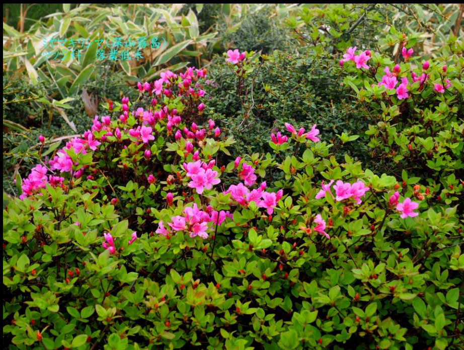
ミヤマキンマ(深山霧島) ツツジ科 落葉低木