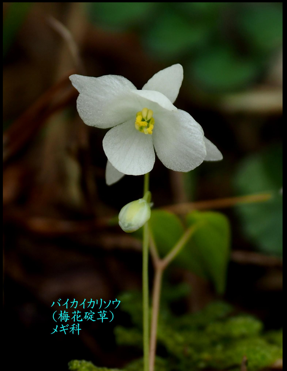
バイカイリソウ (梅花碇草) メギ科