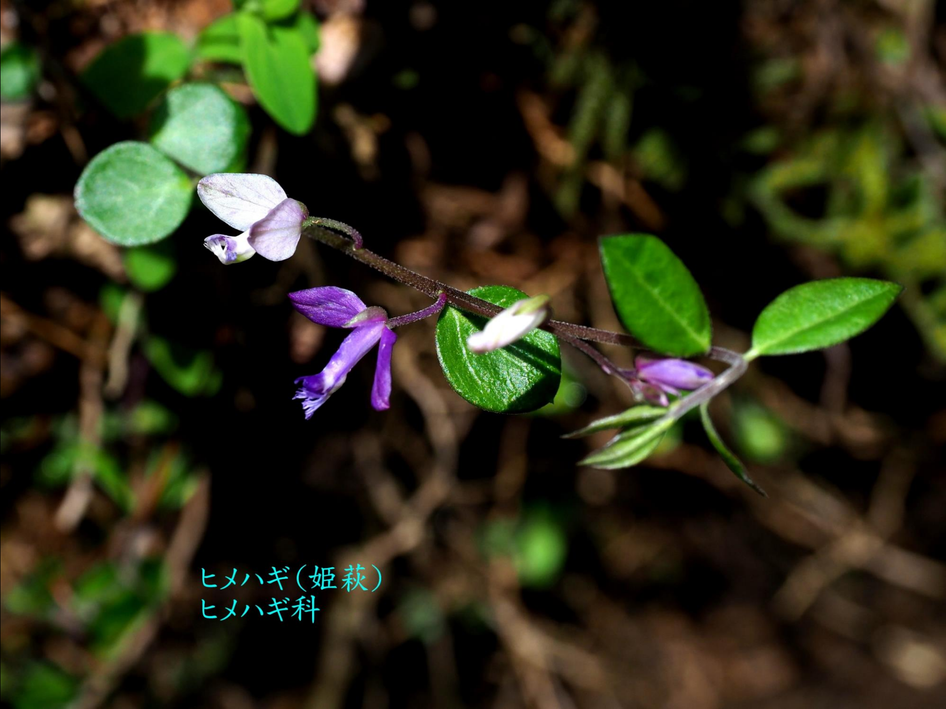
ヒメハギ(姫萩) ヒメハギ科