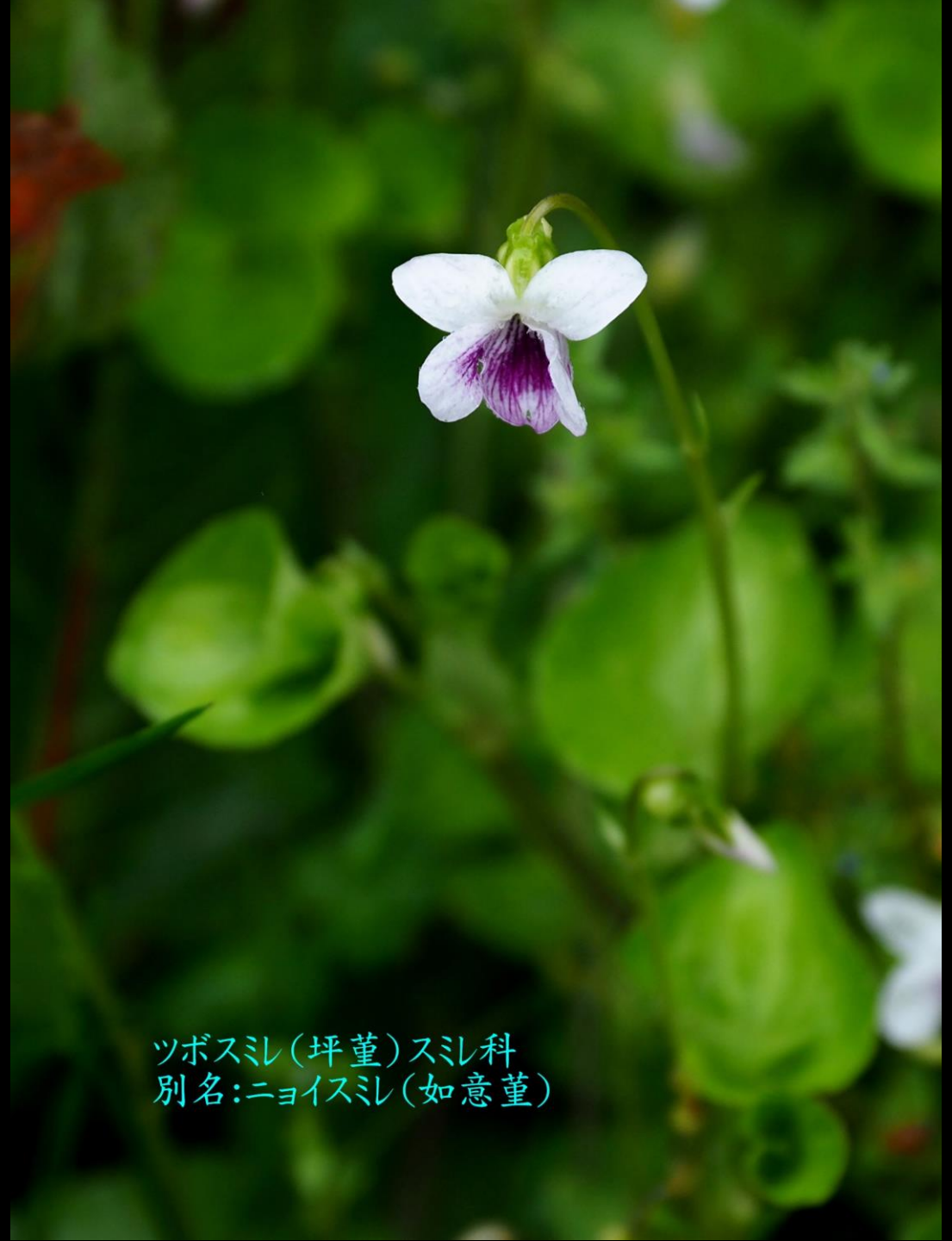
ツボスミ(坪菫)スミ科 別名:ニョイスミ(如意菫)