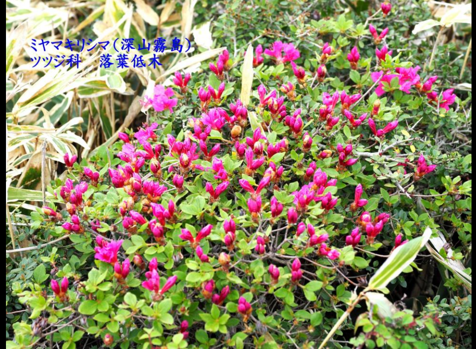
ミヤマキリシマ(深山霧島) ツツジ科 落葉低木