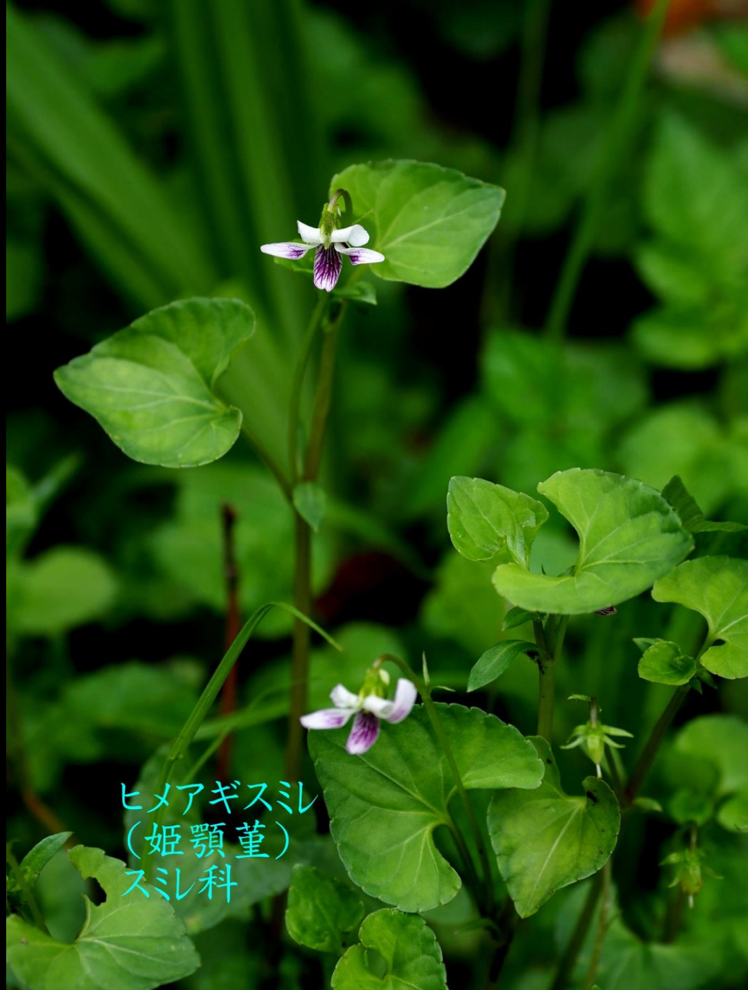
ヒメアギスミ (姫顎堇) スミ科