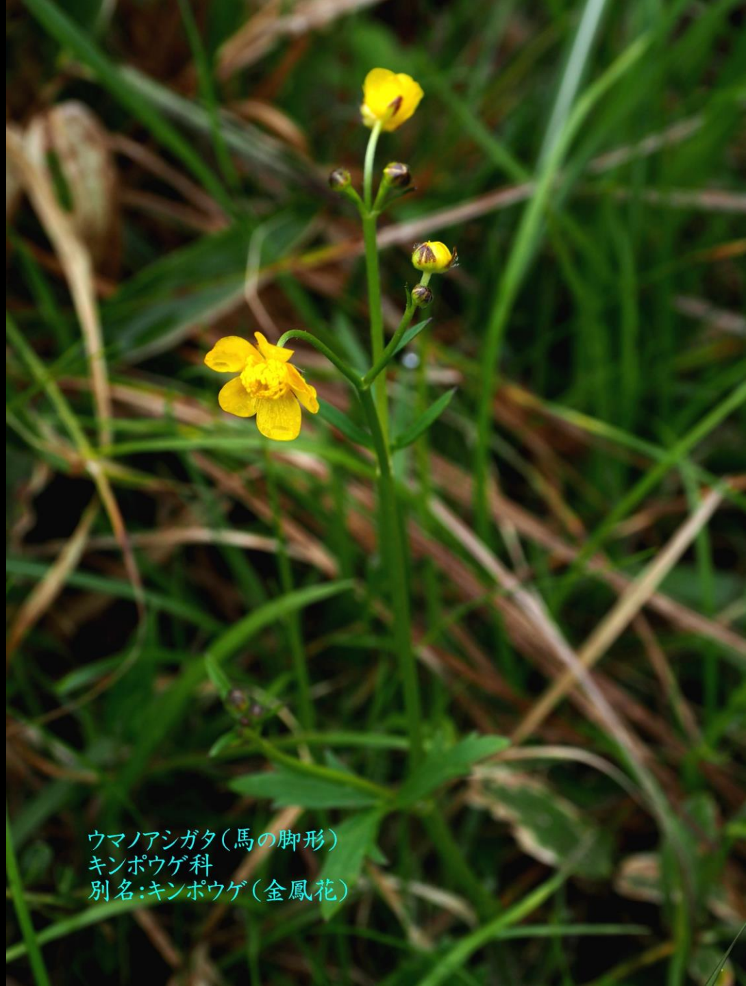
ウマノアシガタ(馬の脚形) キンポウゲ科 別名:キンポウゲ(金鳳花)