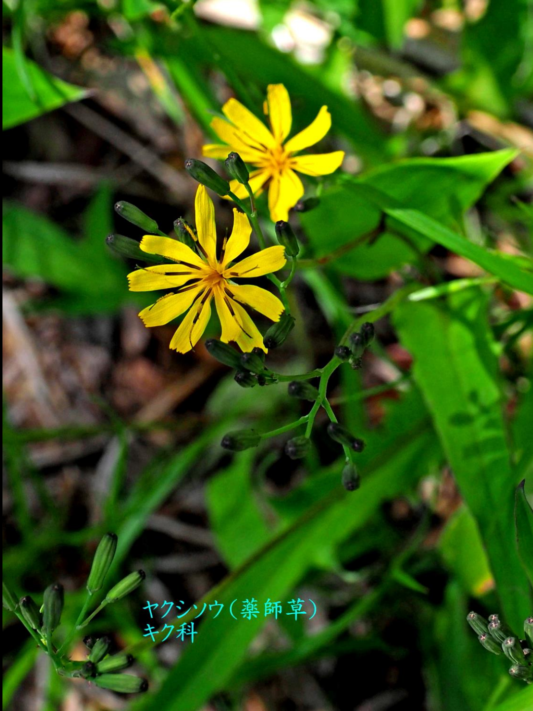
ヤクシソウ(薬師草) キク科