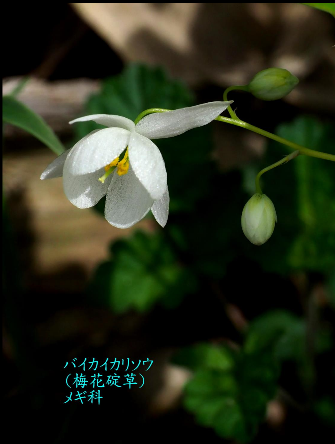
バイカイリソウ (梅花碇草) メギ科