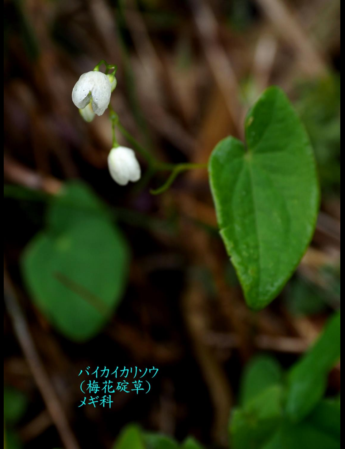
バイカイカリソウ (梅花碇草) メギ科