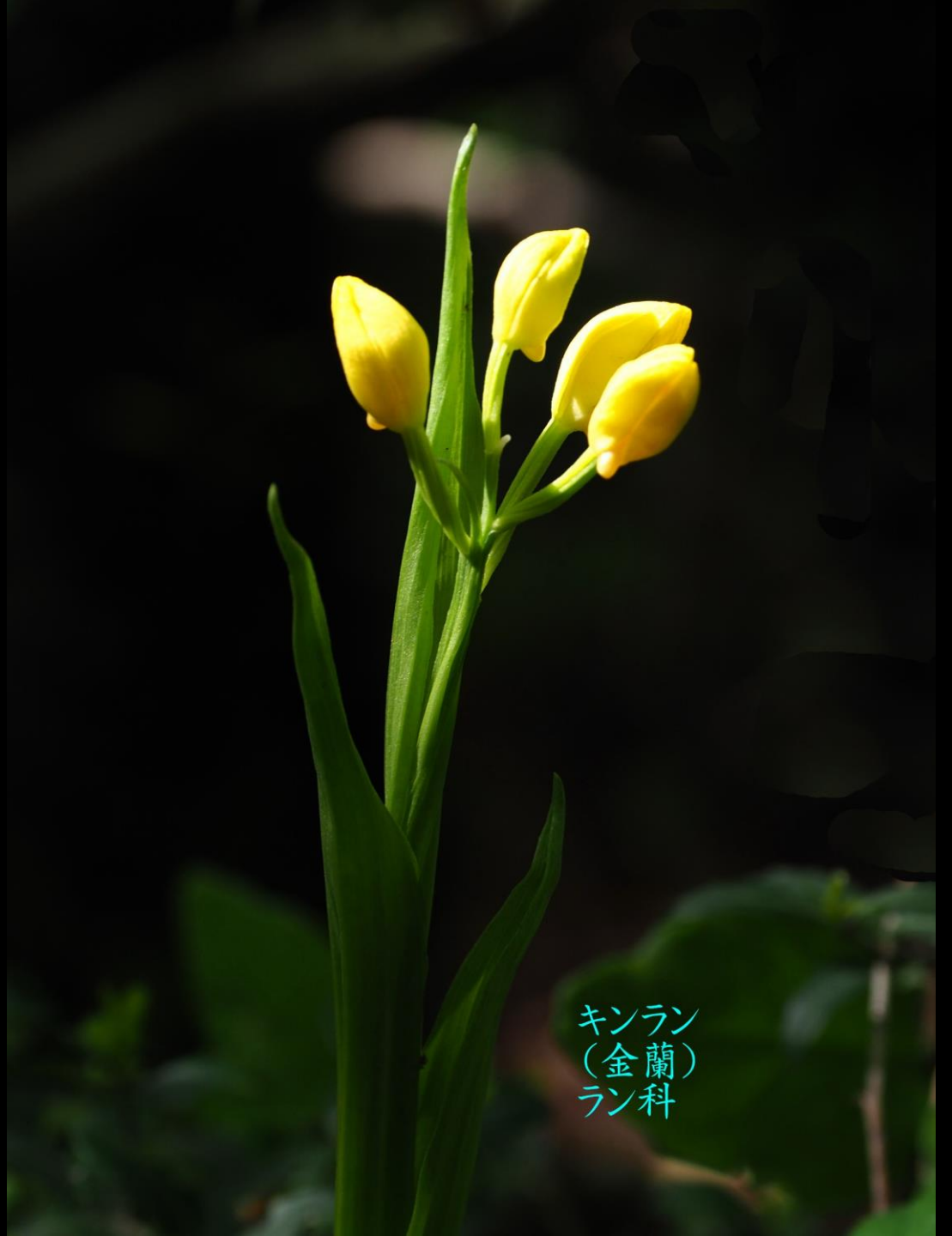
キンラン (金蘭) ラン科