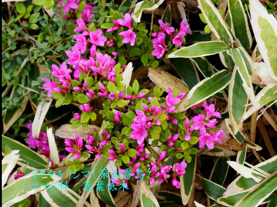
ミヤマキンマ(深山霧島) ツツジ科 落葉低木