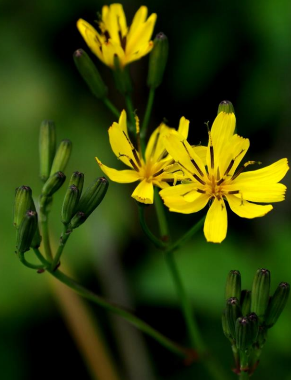
ヤクシソウ(薬師草) キク科