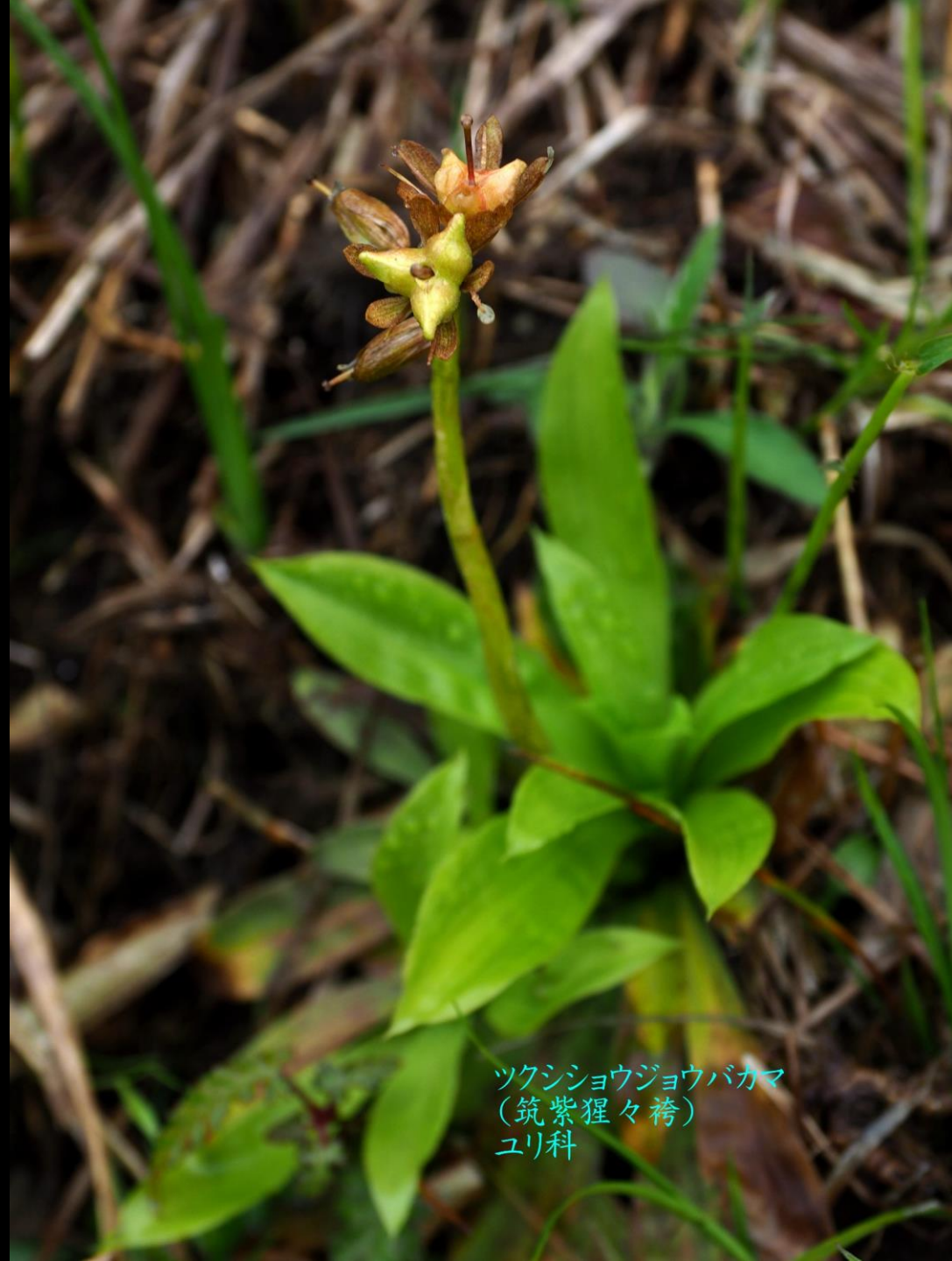
ツクシショウジョウバカマ (筑紫猩々袴) ユリ科