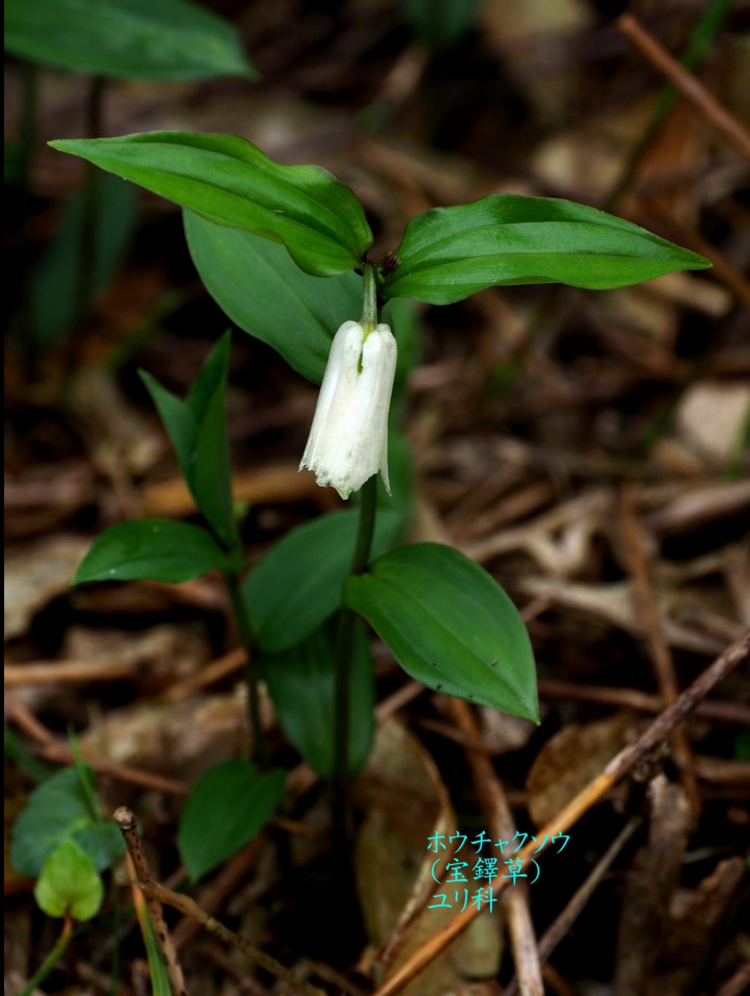
ホウチャクソウ (宝鐸草) ユリ科