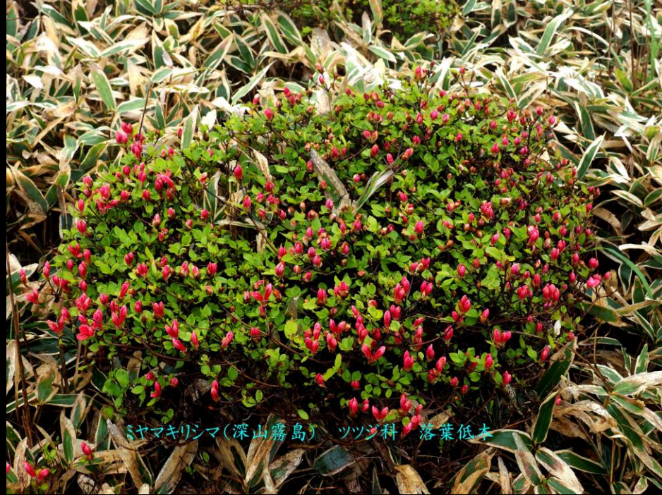
ヤマキリシマ(深山霧島) ツツジ科 落葉低木