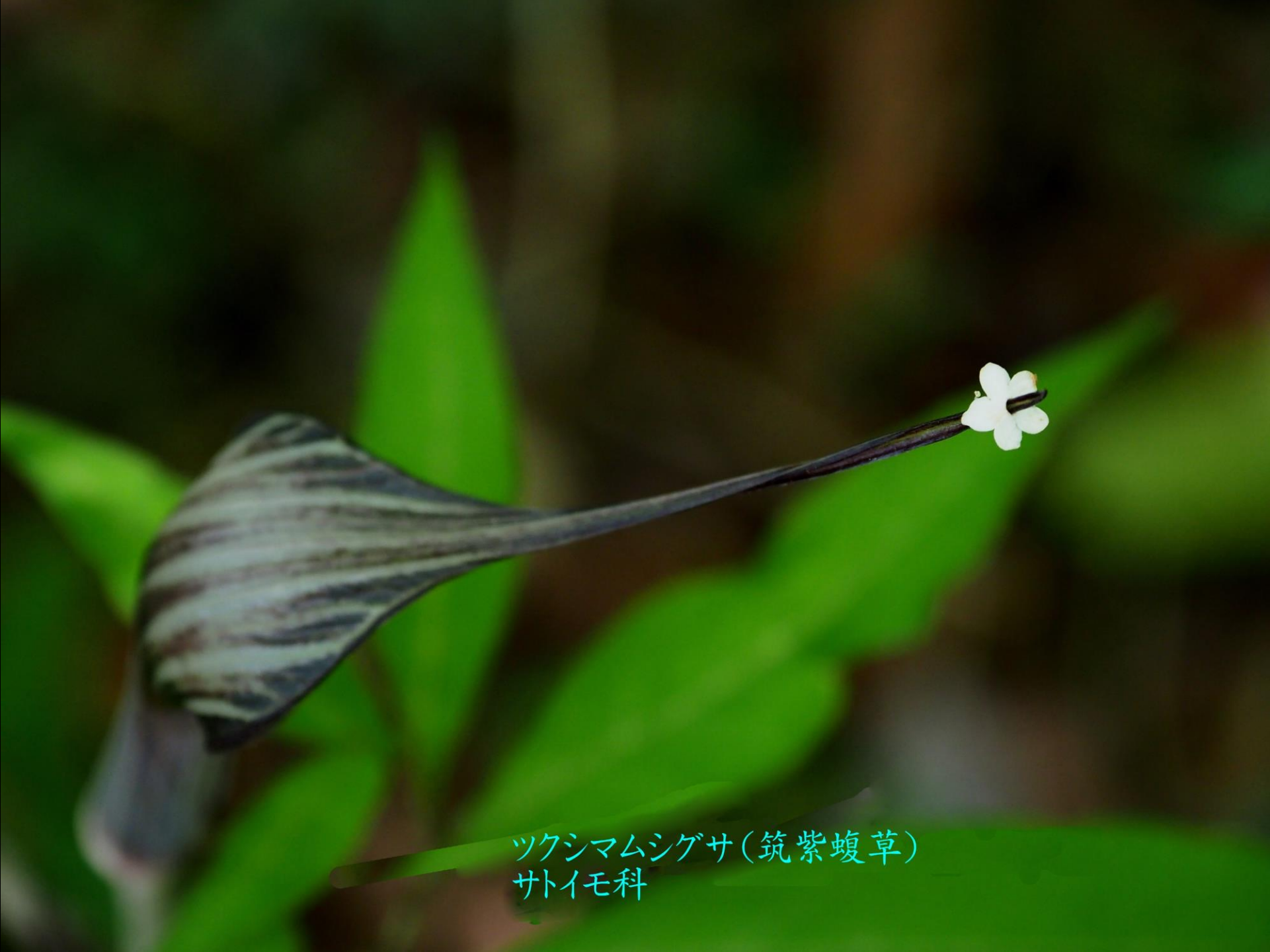
ツクシマムシゲサ(筑紫蝮草) サトイモ科