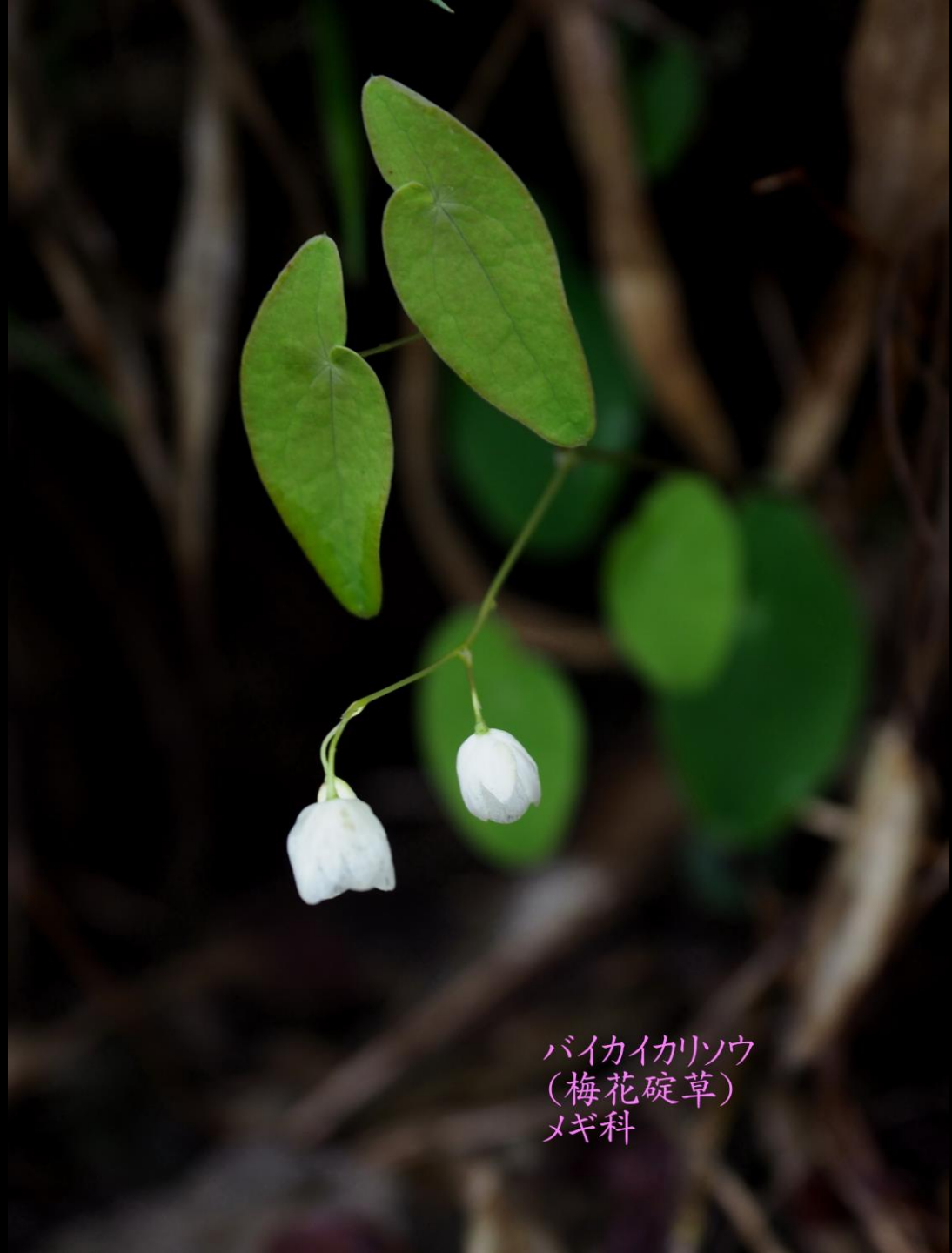
バイカイカリソウ (梅花碇草) メギ科