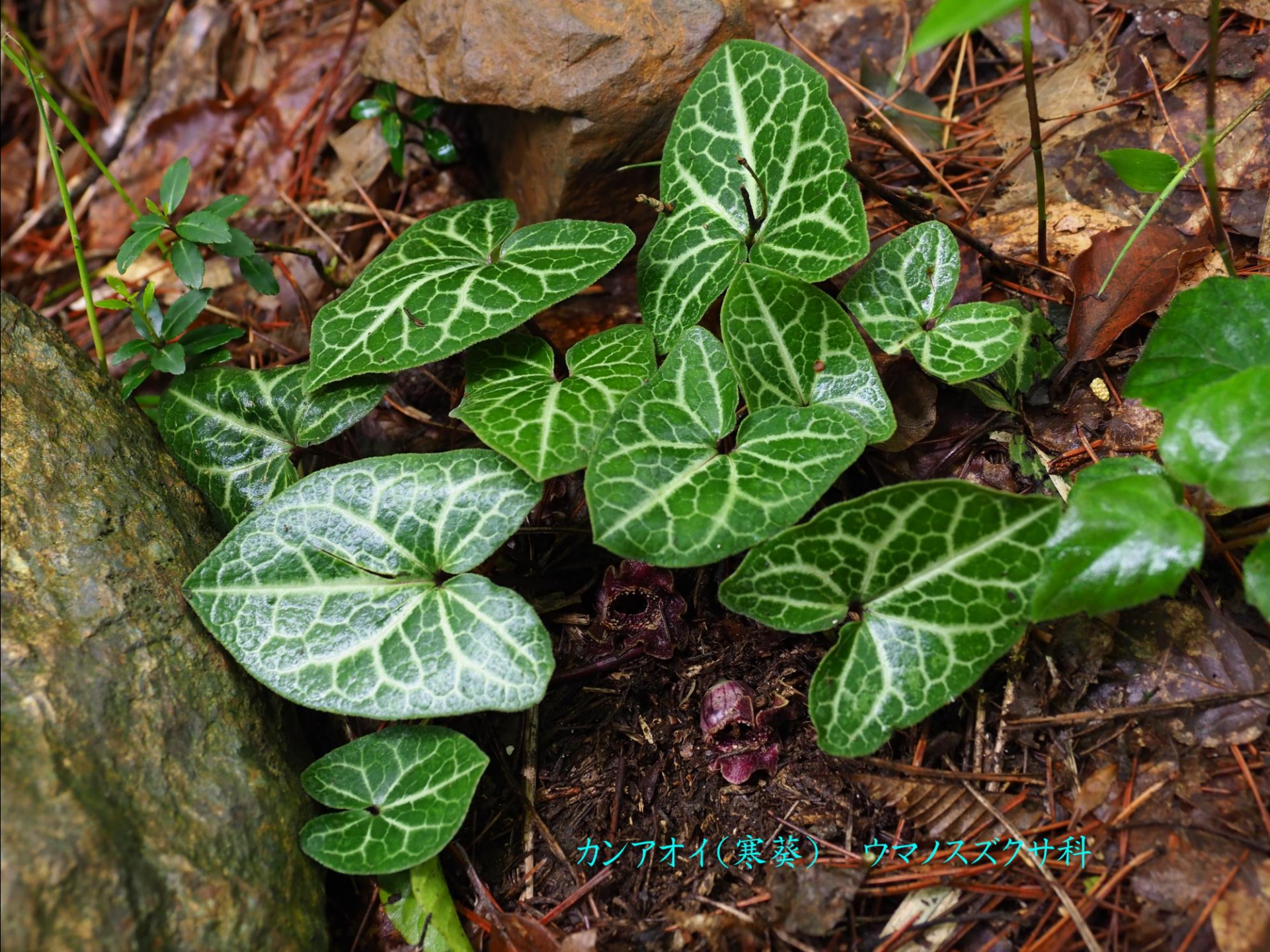
カンアオイ(寒葵) ウマノスズクサ科