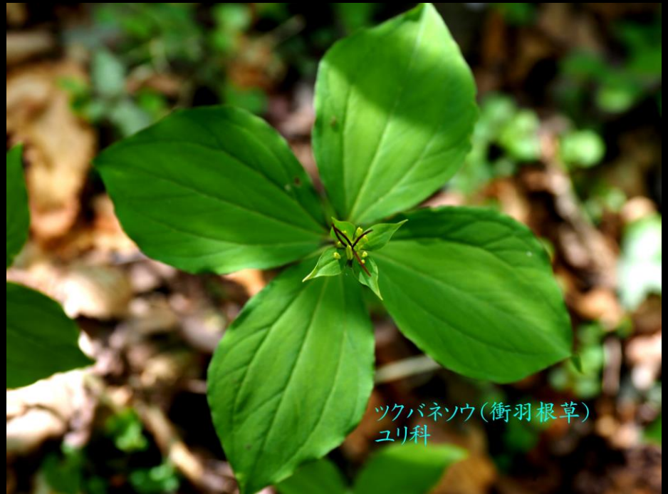
ツクバネソウ(衝羽根草) ユリ科