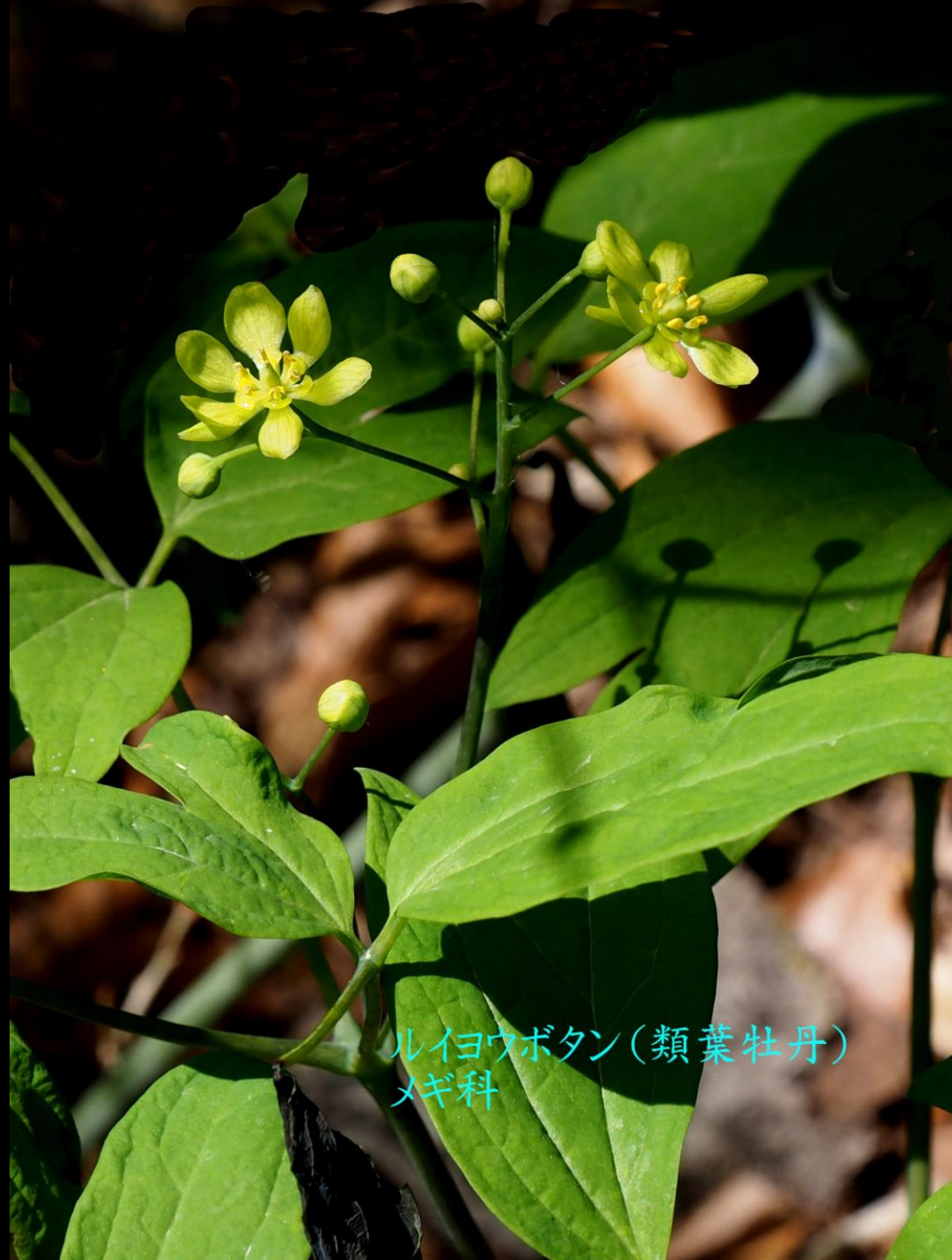
ルイヨウボタン(類葉牡丹) メギ科