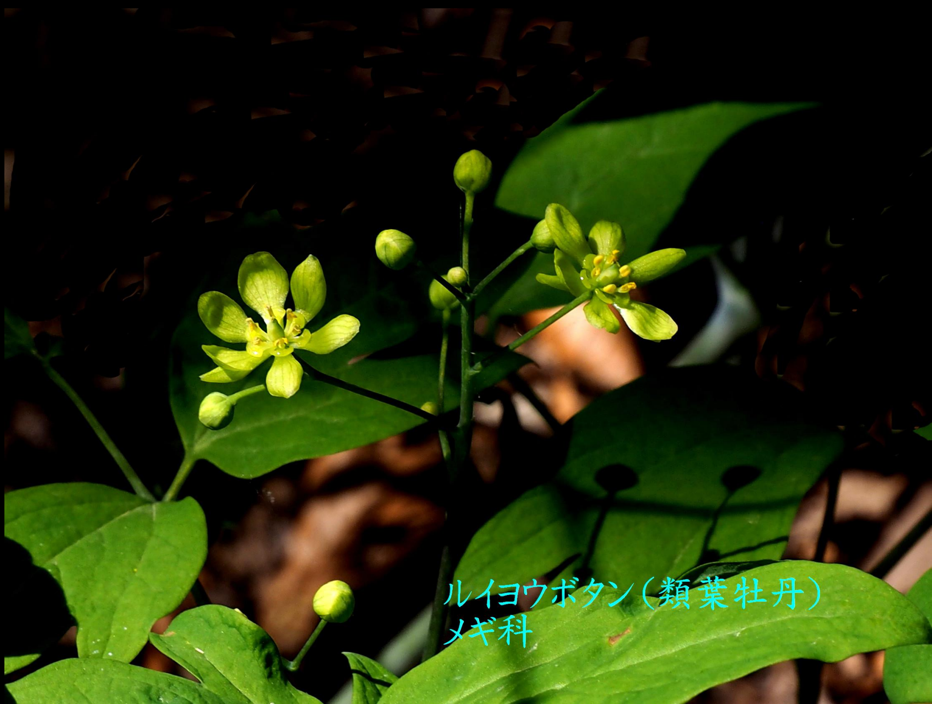
ルイヨウボタン(類葉牡丹) メギ科