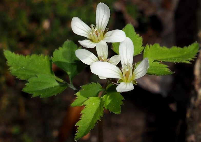
ミツバコンロンソウ (三つ葉崑崙草) アブラナ科