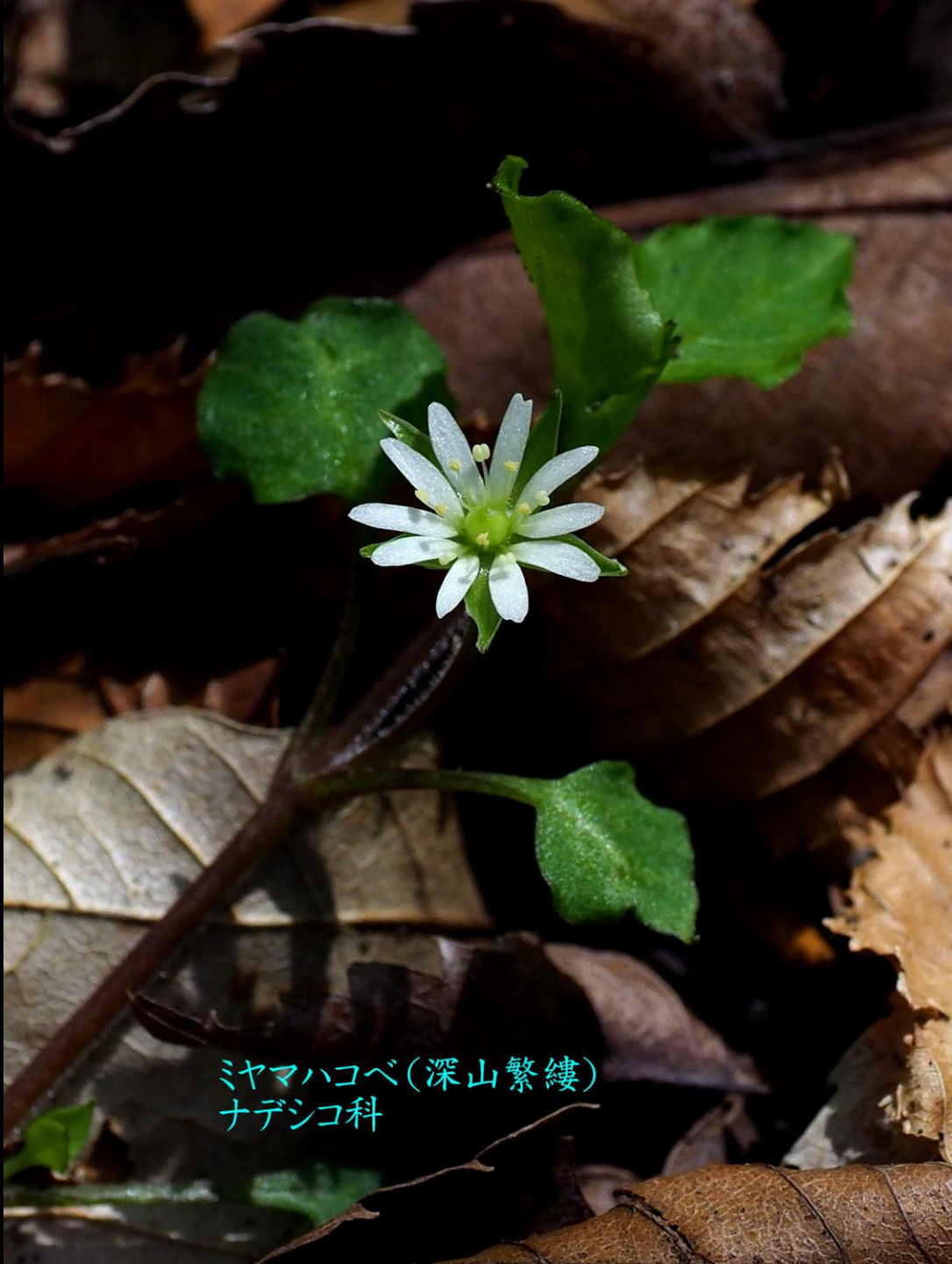
ミヤマハコベ(深山繁縷) ナデシコ科