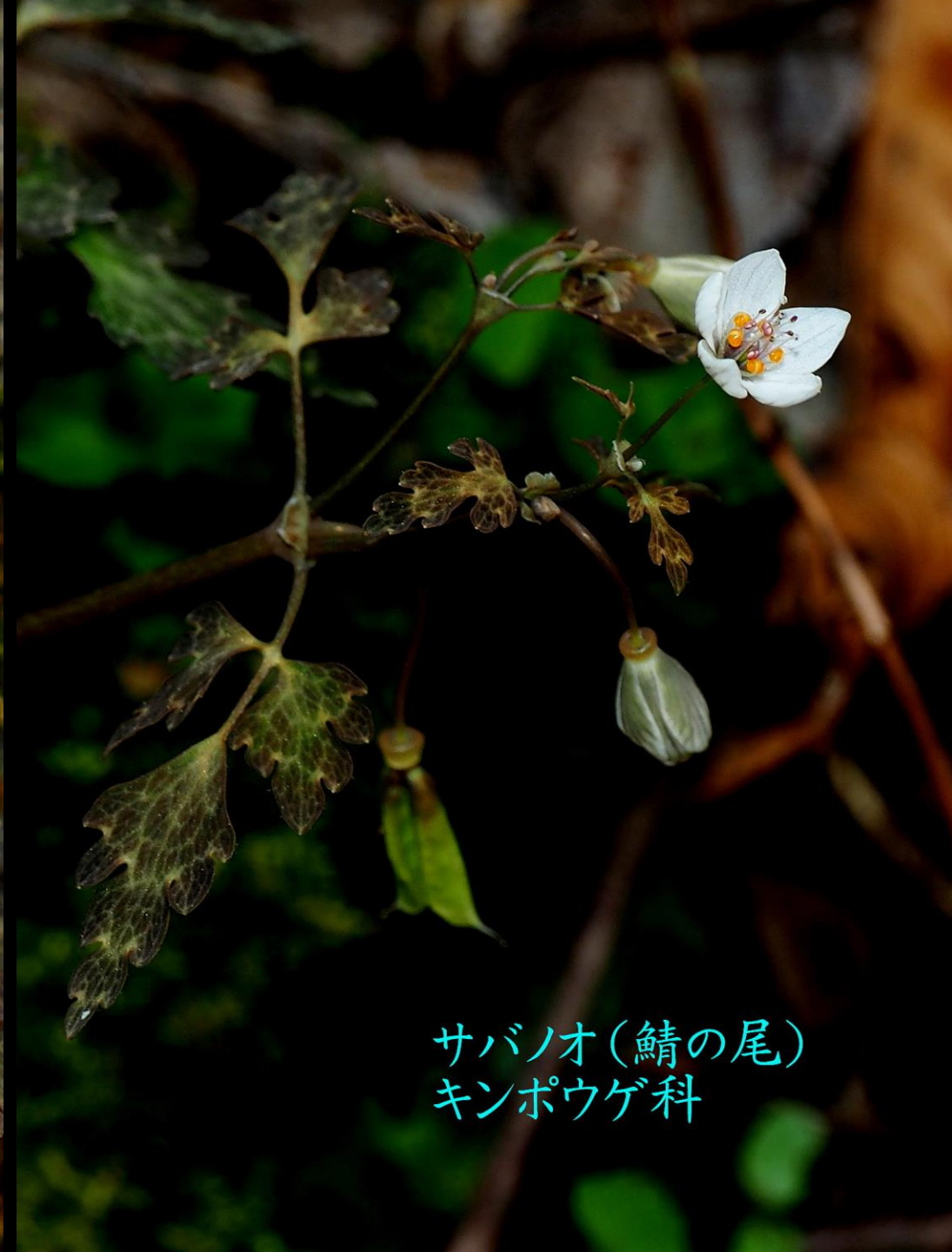
サバノオ(鯖の尾) キンポウゲ科