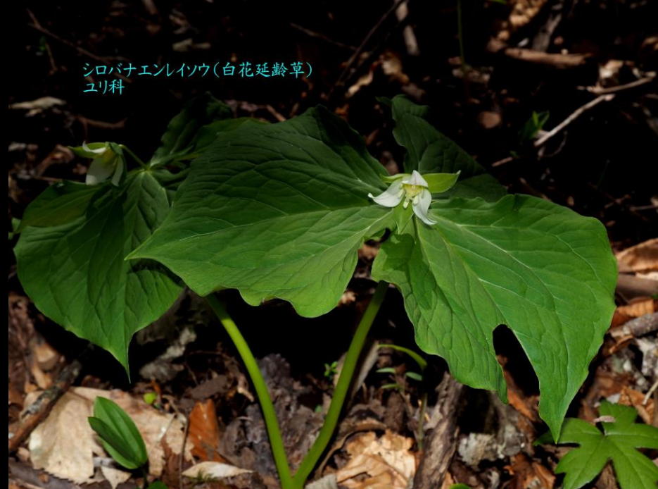
シロバナエンレイソウ(白花延齡草) ユリ科