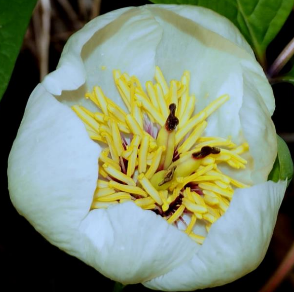
ヤマシャクヤク(山芍薬) キンポウゲ科