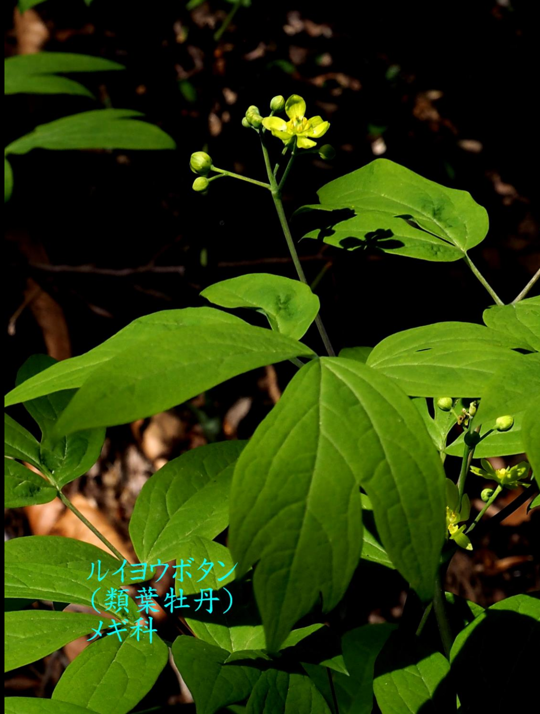
ルイヨウボタン (類葉牡丹) メギ科