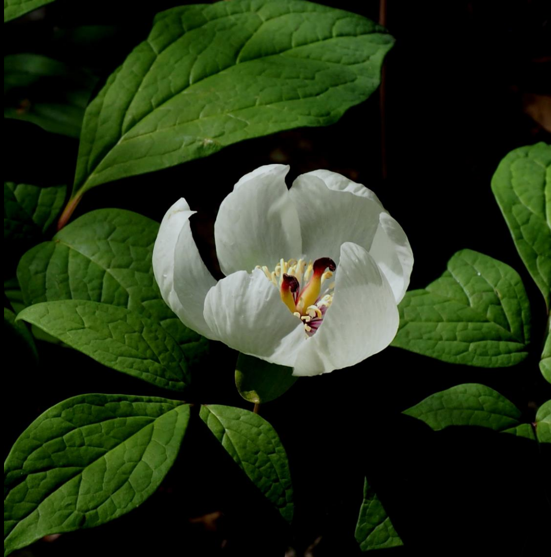
ヤマシャクヤク(山芍薬) キンポウゲ科