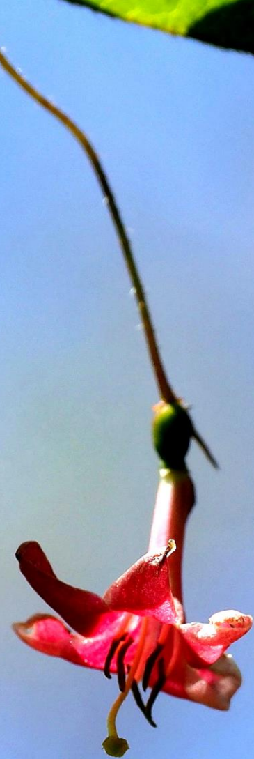
ミヤマウグイスカゲラ(深山鶯神楽) スイカズラ科 落葉低木