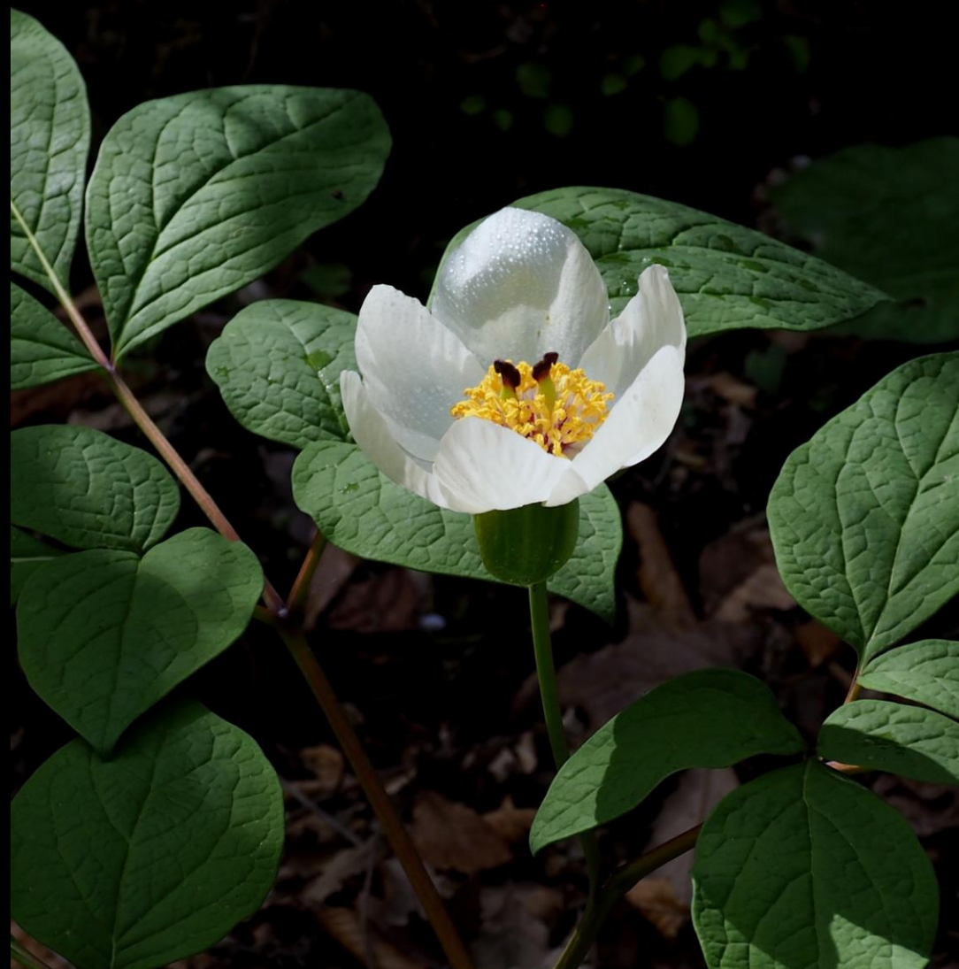
ヤマシャクヤク(山芍薬) キンポウゲ科