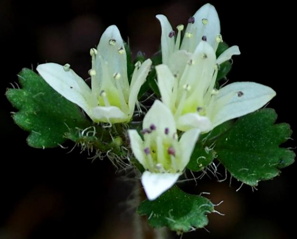
シロバナネコノメソウ (白花猫の目草) ユキノシタ科