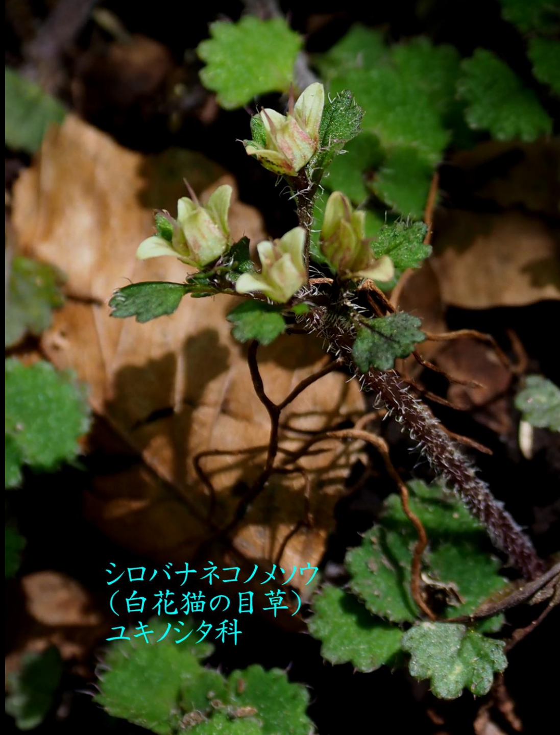
シロバナネコノメソウ (白花猫の目草) ユキノシタ科