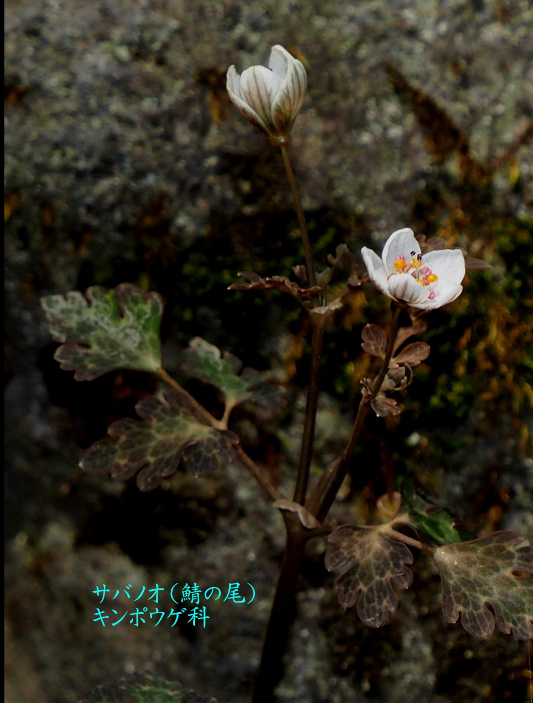
サバノオ(鯖の尾) キンポウゲ科