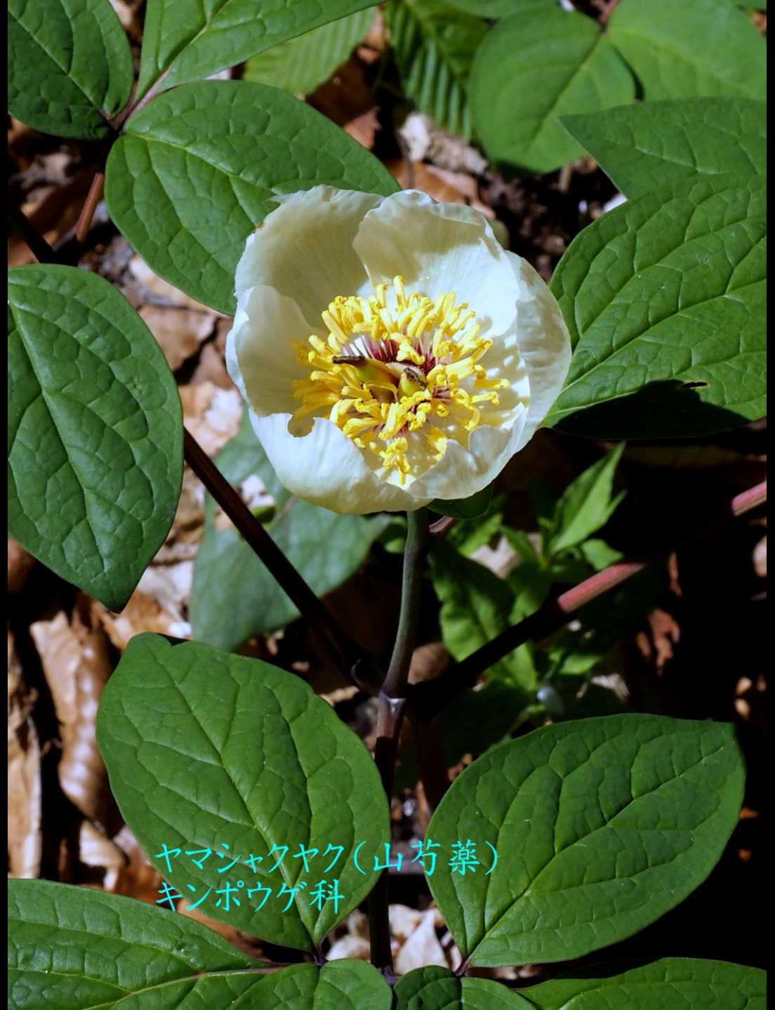
ヤマシャクヤク(山芍薬) キンポウゲ科