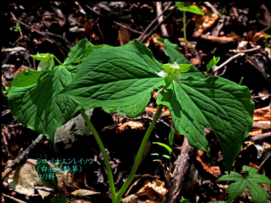
シロバナエンレイソウ (白花延齡草) ユリ科