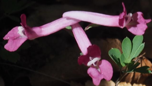
ジロボウエンゴサク (次郎坊延胡索) ケシ科