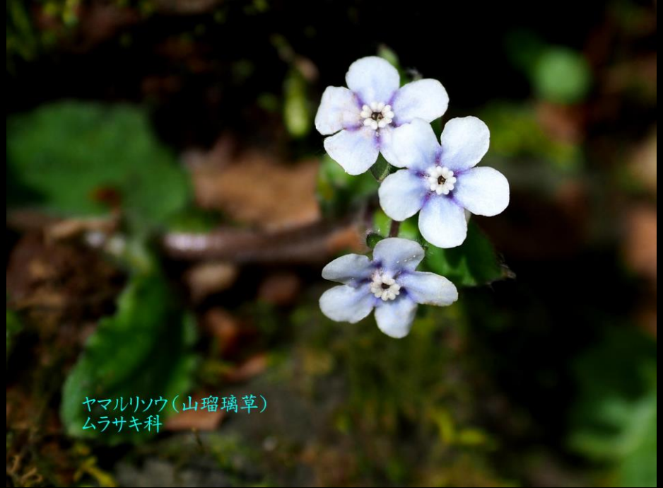
ヤマリソウ(山瑠璃草) ムラサキ科