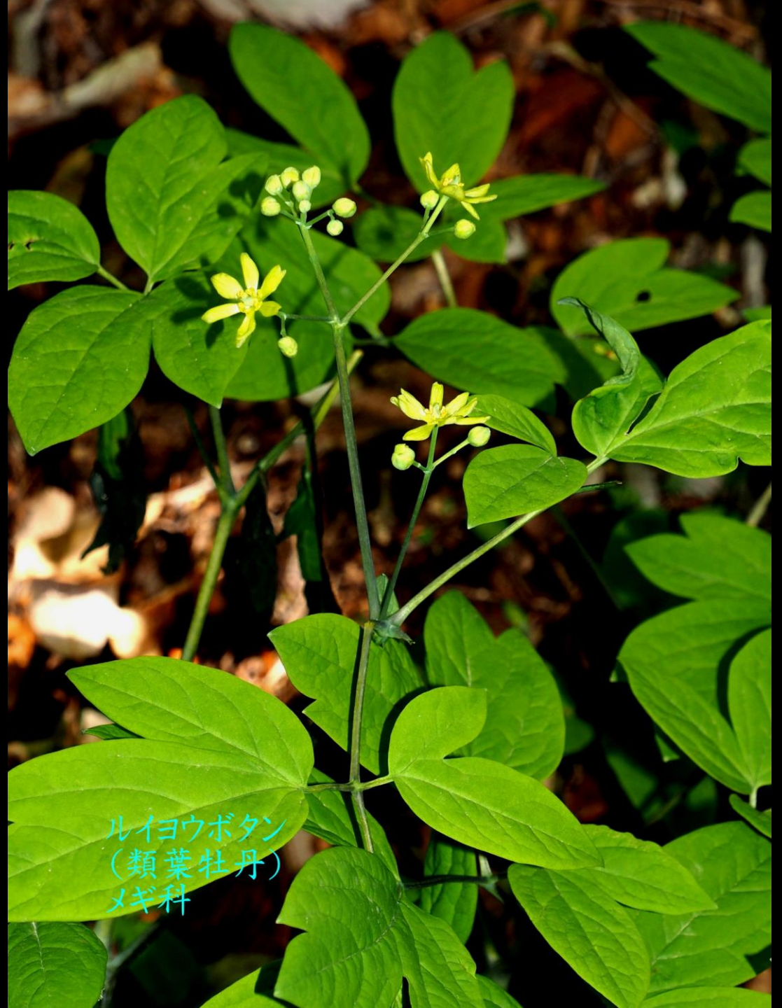
ルイヨウボタン (類葉牡丹) メギ科