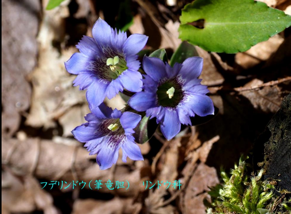
フデリンドウ(筆竜胆) リンドウ科