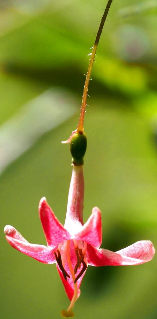
ミヤマウグイスカゲラ(深山鶯神楽) スイカズラ科 落葉低木