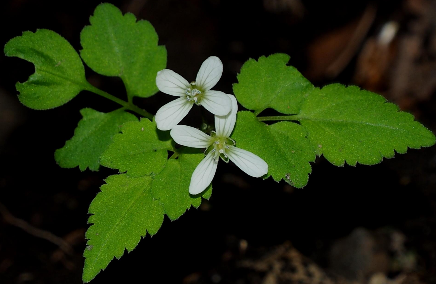
ミツバコンロンソウ(三つ葉崑崙草) アブラナ科