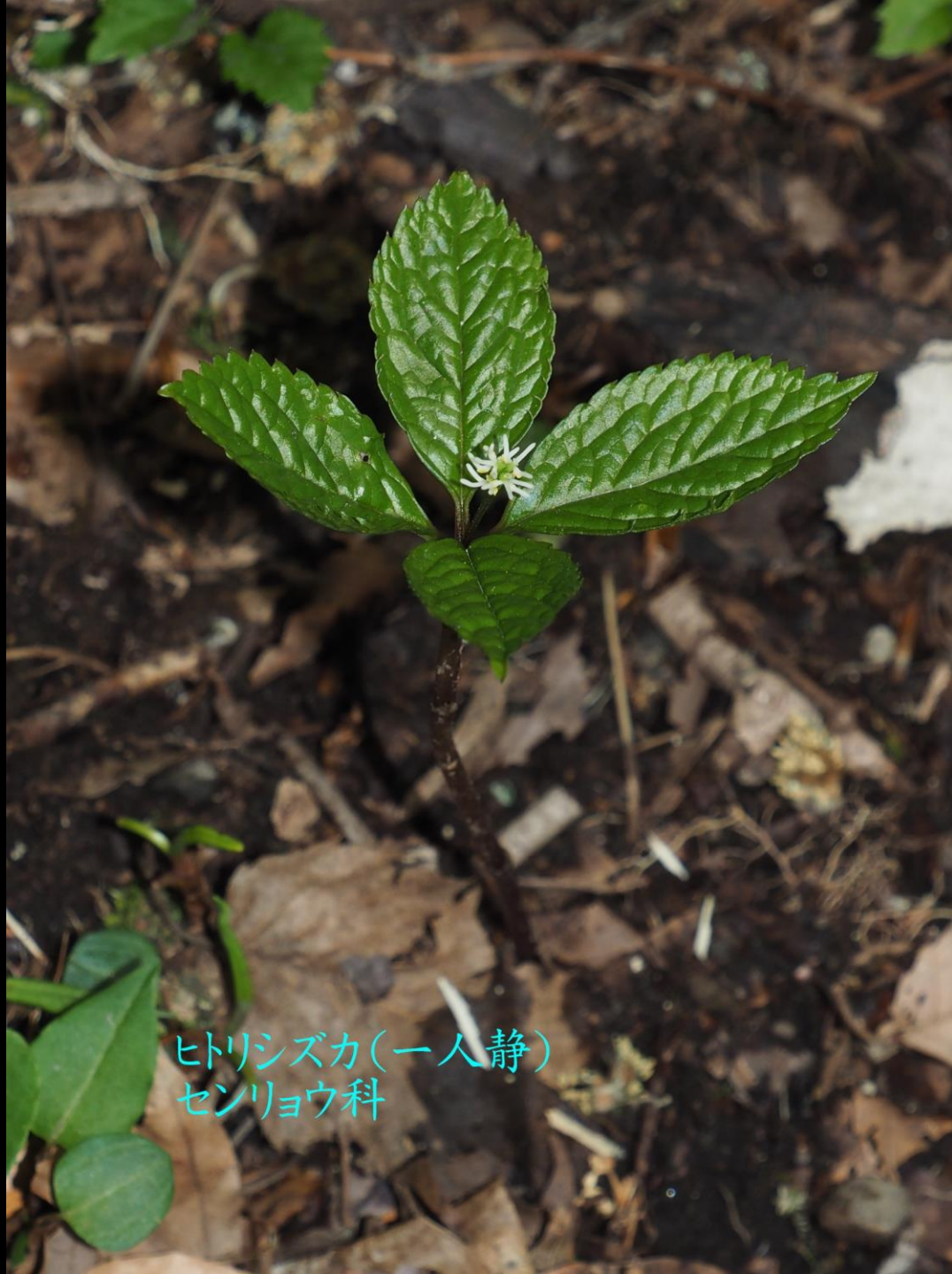
ヒトリシズカ(一人静) センリョウ科