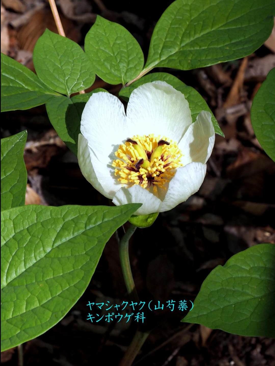
ヤマシャクヤク(山芍薬) キンポウゲ科