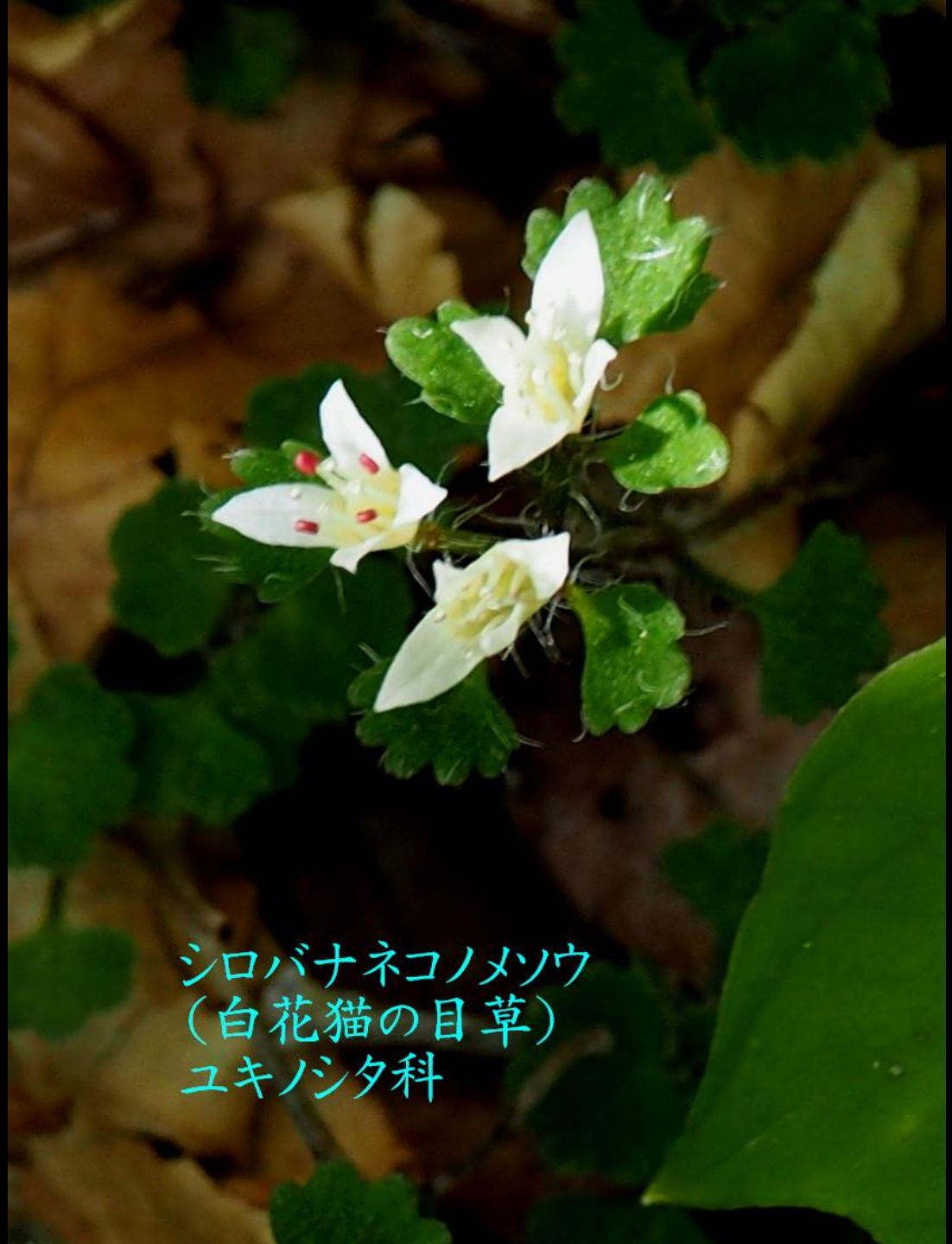
シロバナネコノメソウ (白花猫の目草) ユキノシタ科