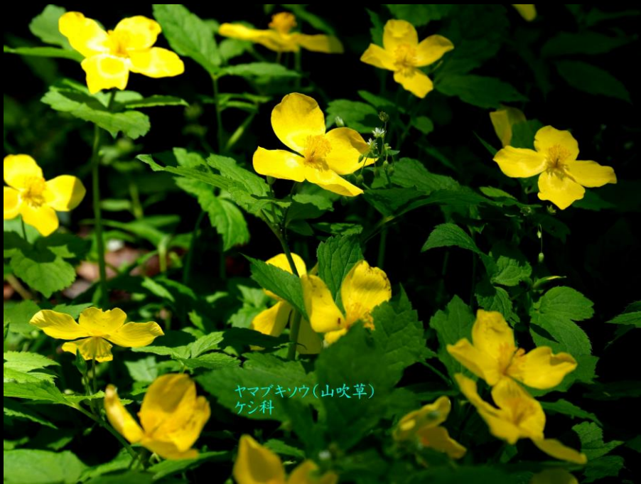
ヤマブキシソウ(山吹草) ケシ科