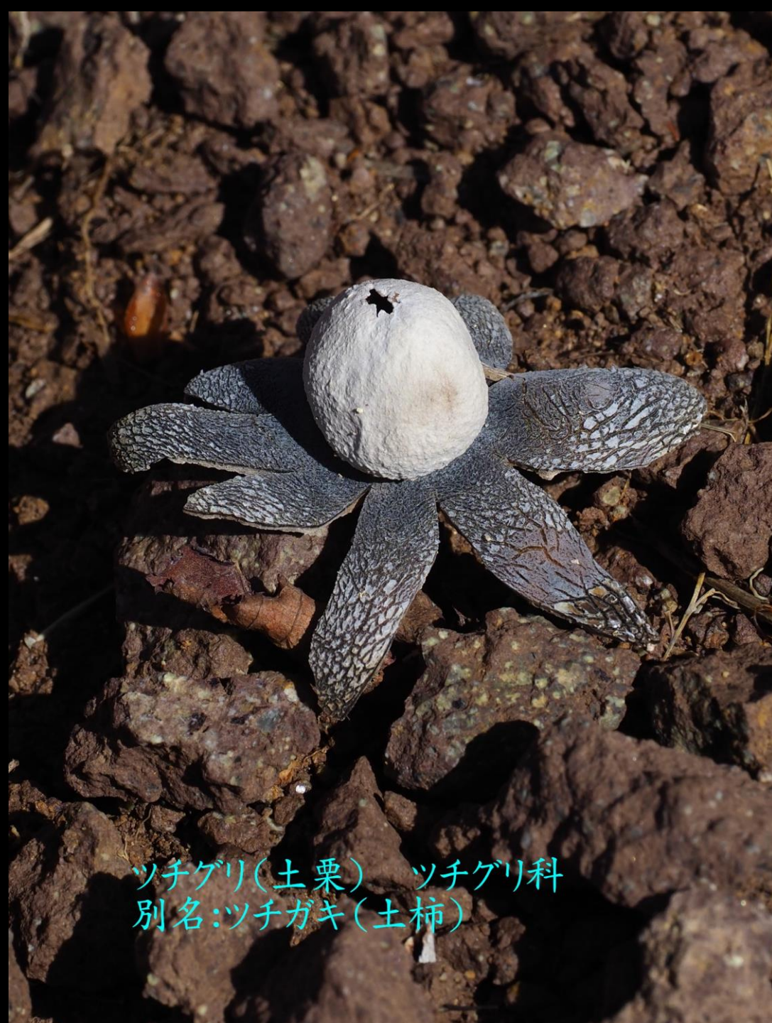
ツチグリ(土栗) ツチグリ科 別名:ツチガキ(土柿)