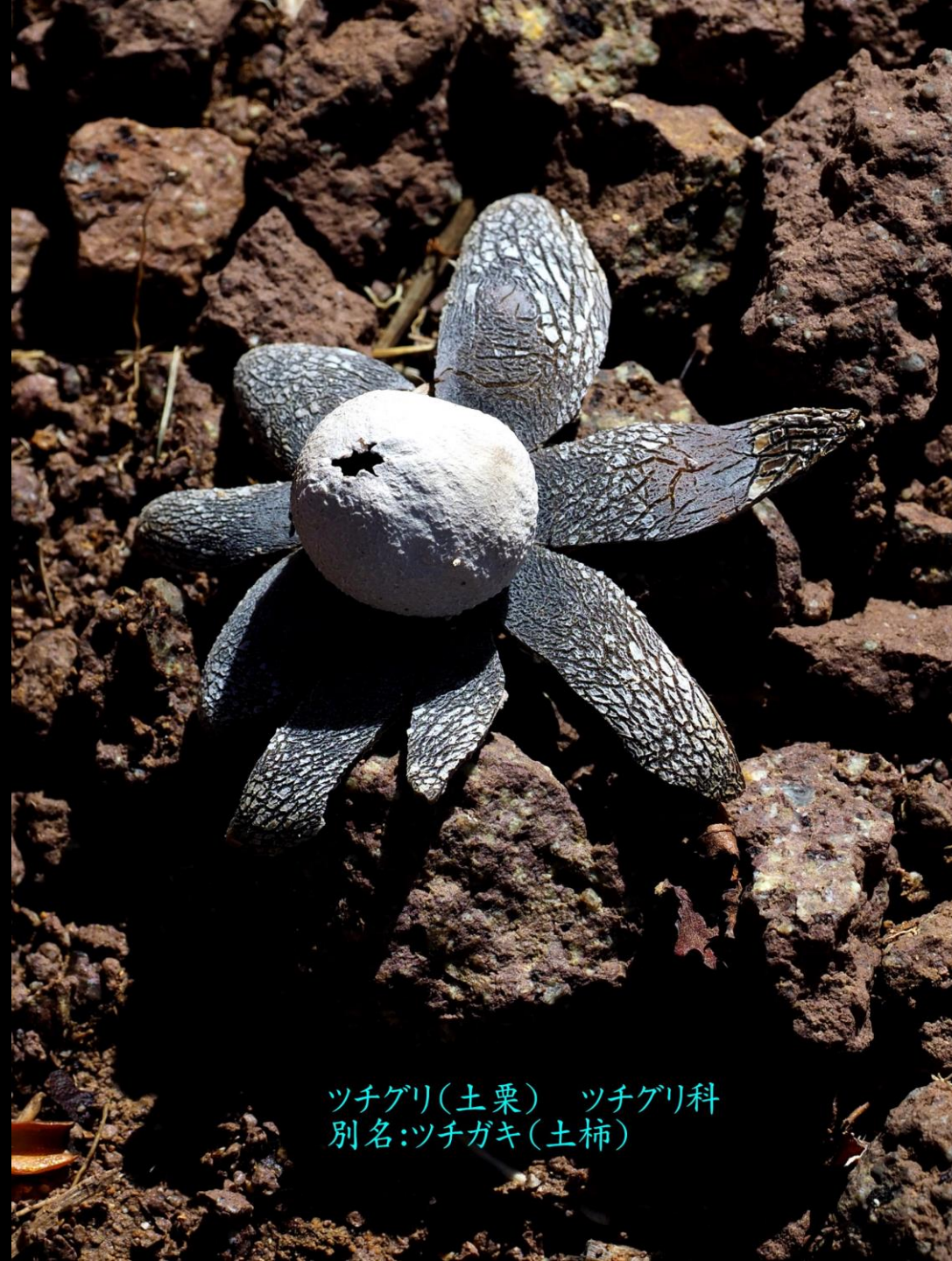
ツチグリ(土栗) ツチグリ科 別名:ツチガキ(土柿)