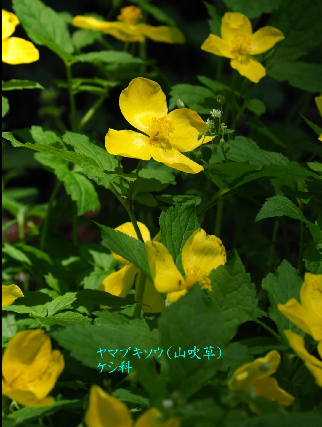
ヤマブキシソウ(山吹草) ケシ科