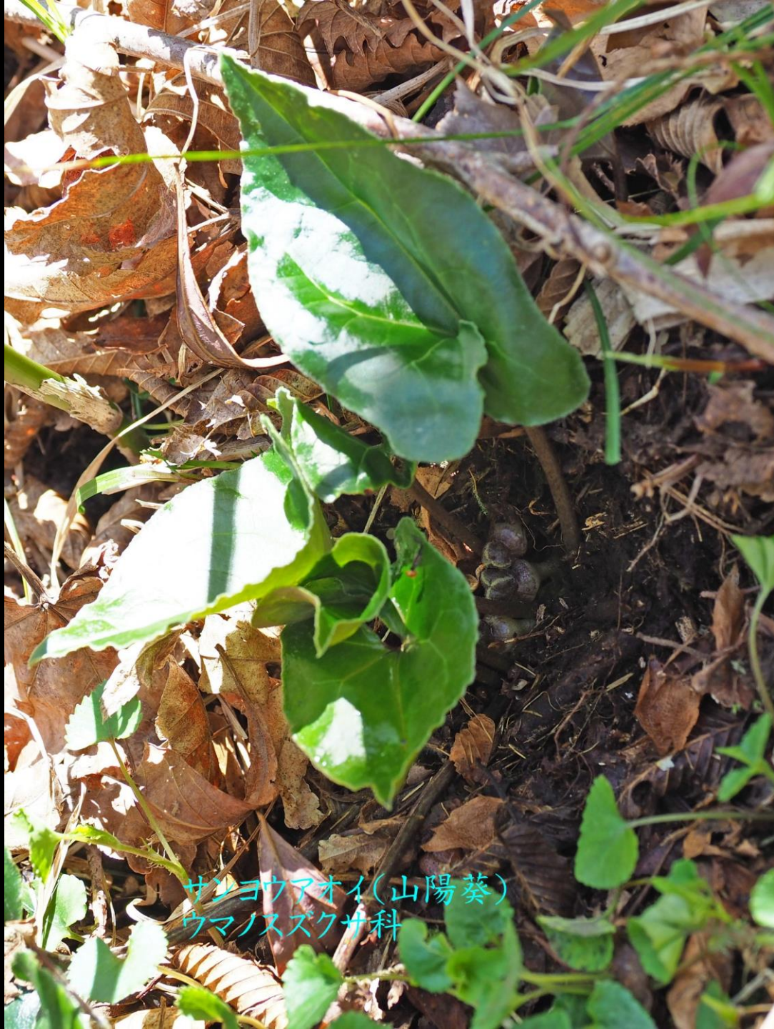
サンヨウアオイ(山陽葵) ウマノスズクサ科