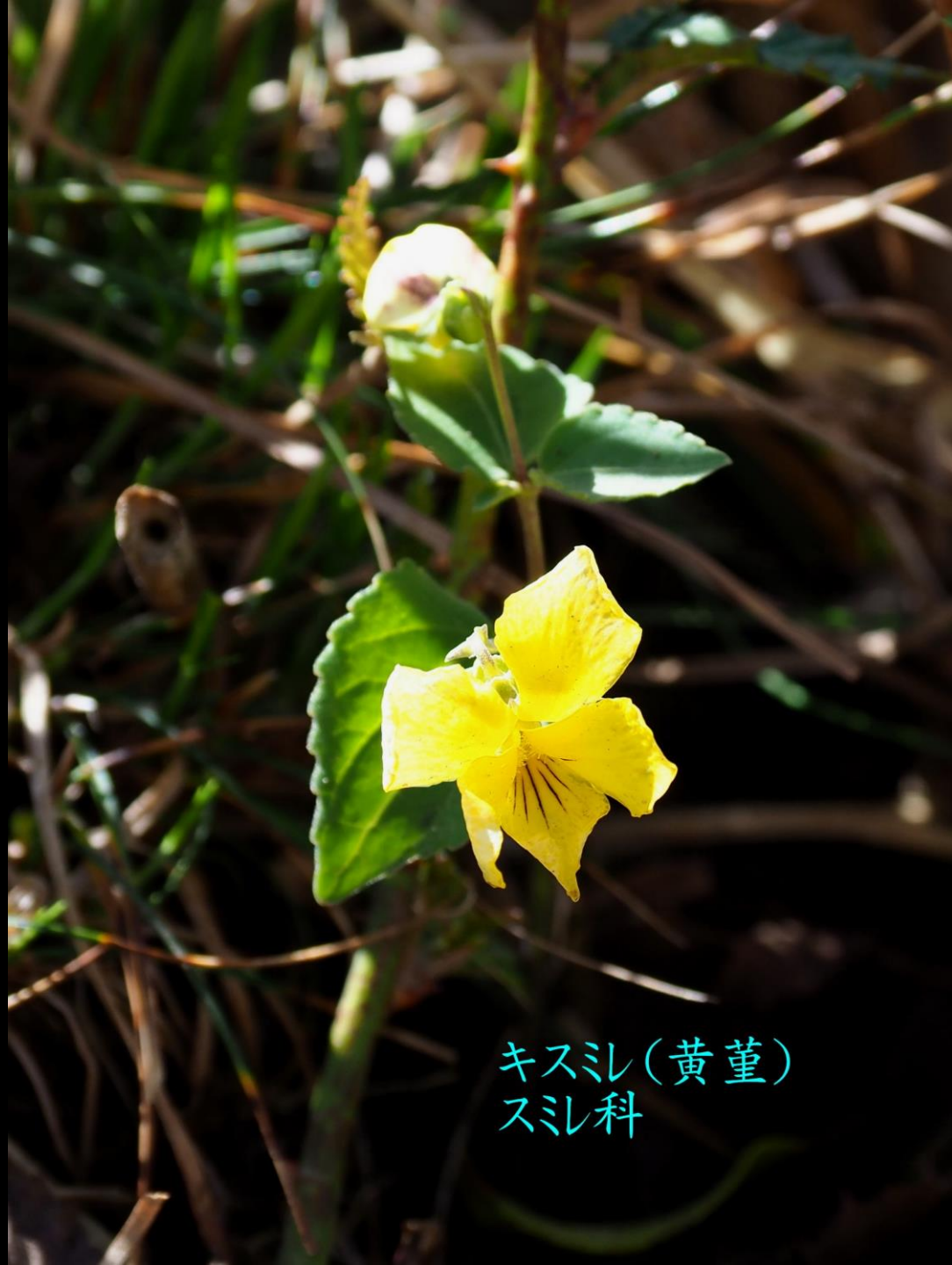
キスシ (黄堇) スシ科