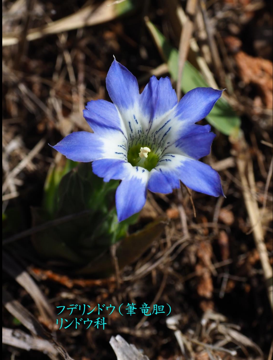
フデリンドウ(筆竜胆) リンドウ科