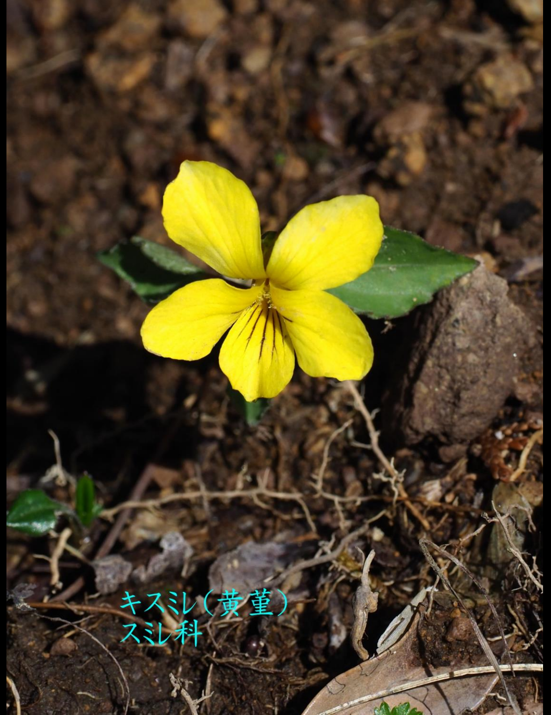
キスシ (黄堇) スシ科