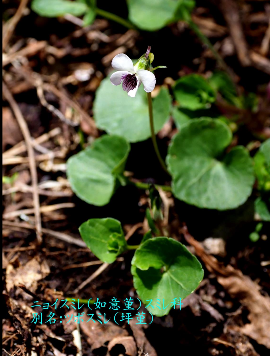
ニョイスミレ(如意堇)スミレ科 別名:ツボスミレ(坪堇)