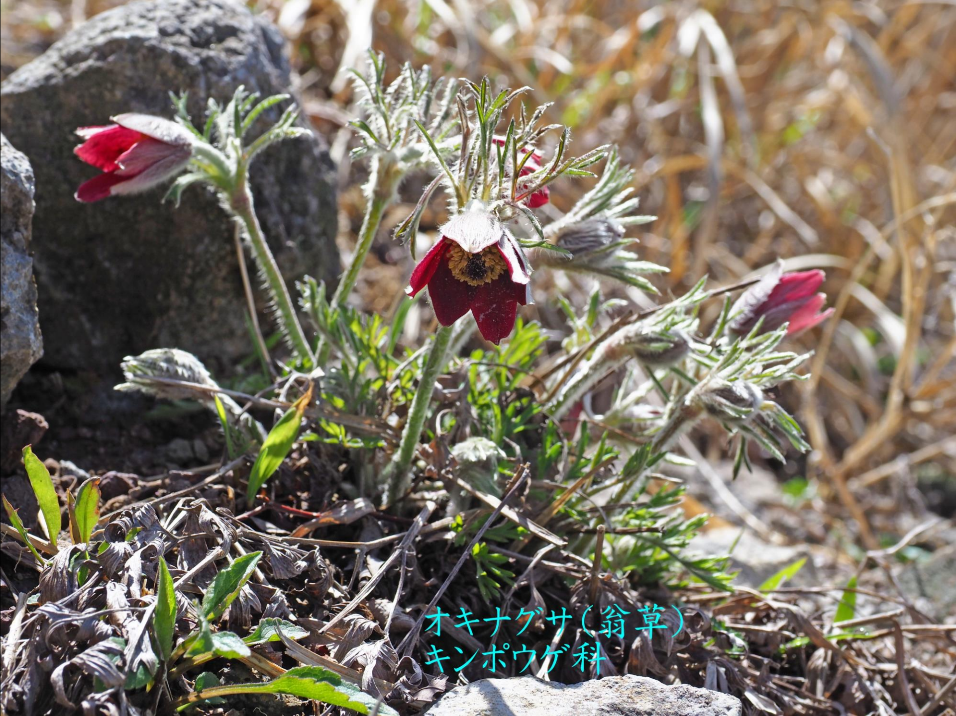
オキナグサ(翁草) キンポウゲ科