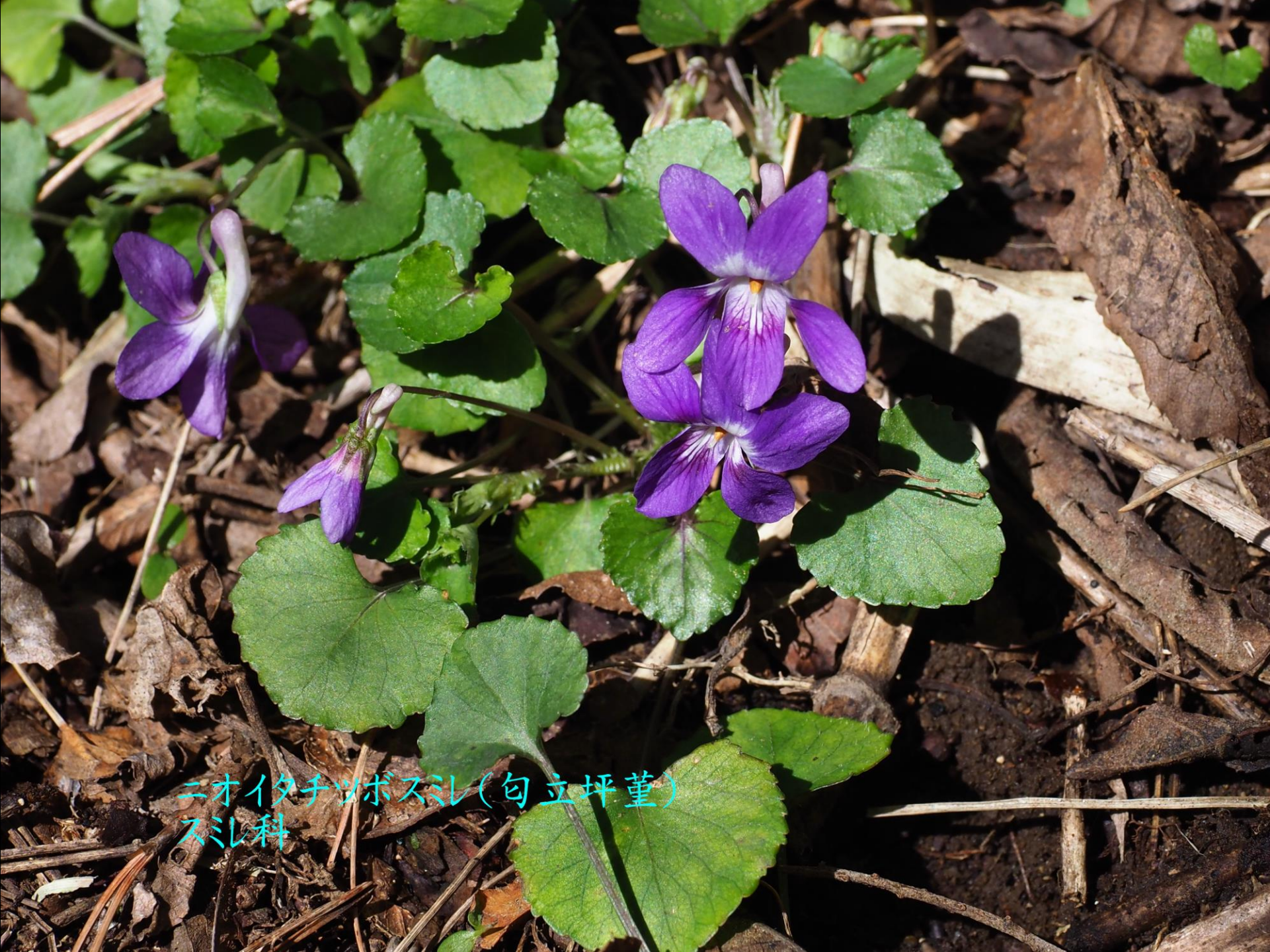
ニオイタチツボスミレ(匂立坪堇) スミレ科