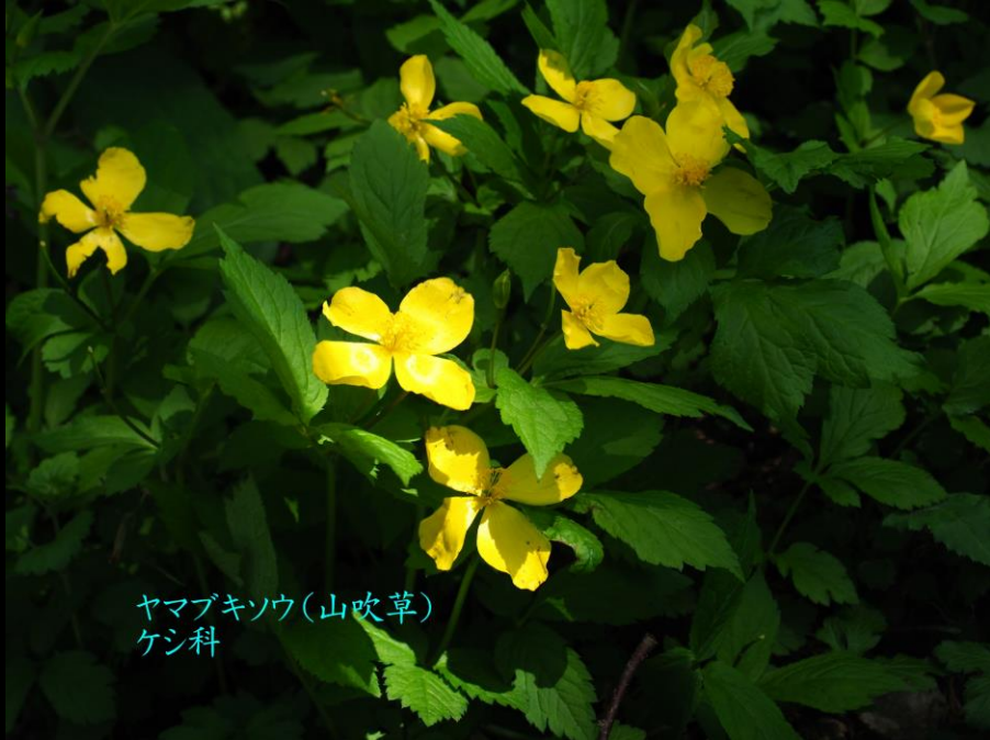
ヤマブキシソウ(山吹草) ケシ科