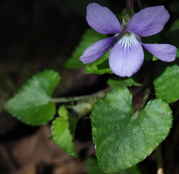
タチツボスミレ(立坪菫) スミレ科