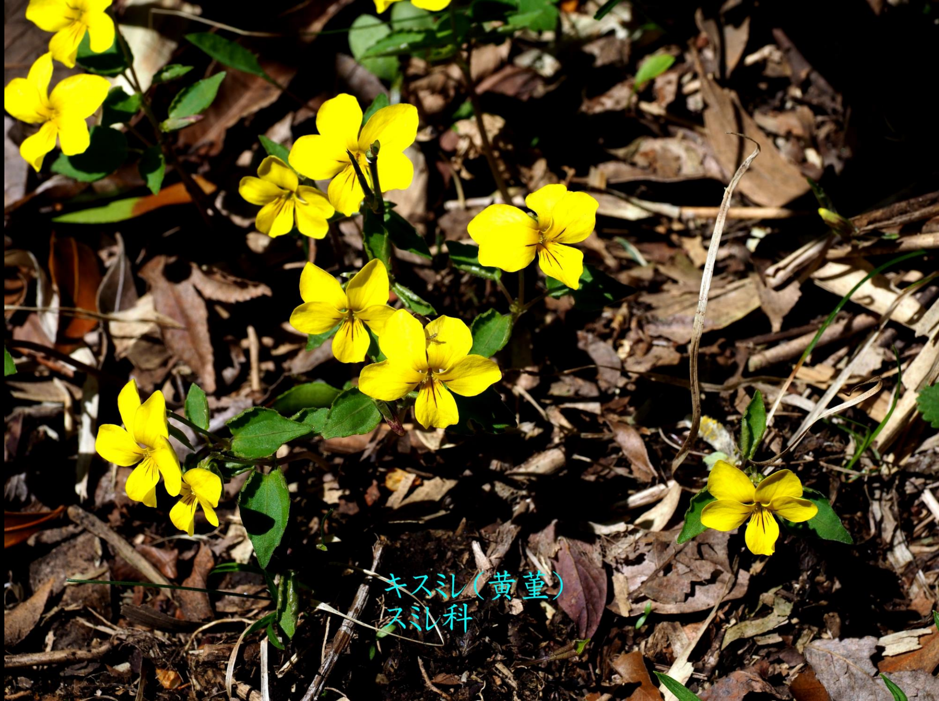
キスシ(黄堇) スシ科