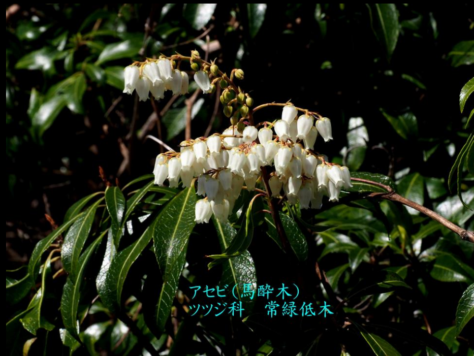
アセビ(馬酔木) ツツジ科 常緑低木