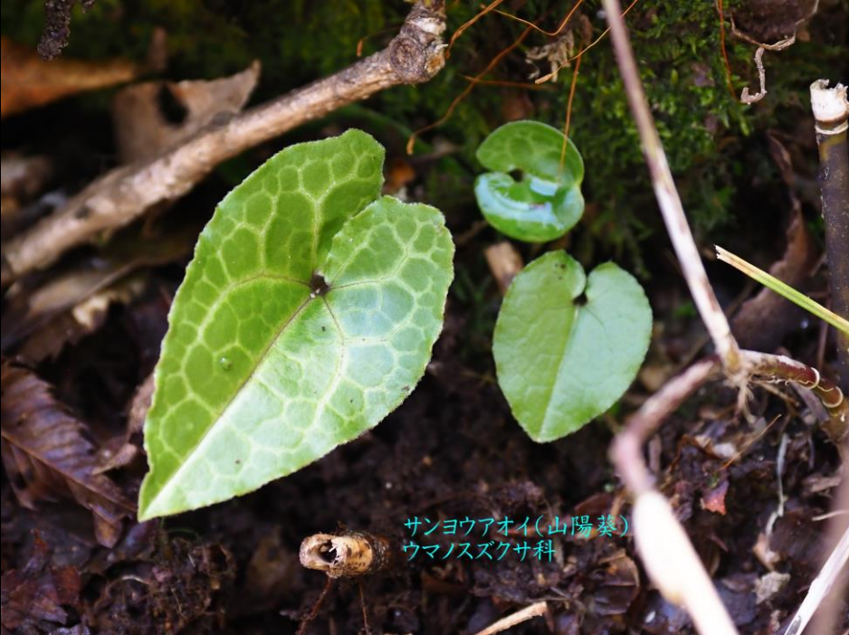
サンヨウアオイ(山陽葵) ウマノスズクサ科