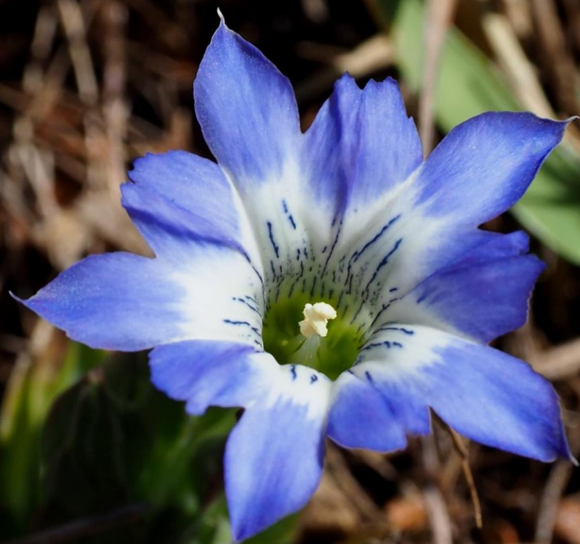
フデリンドウ(筆竜胆) リンドウ科