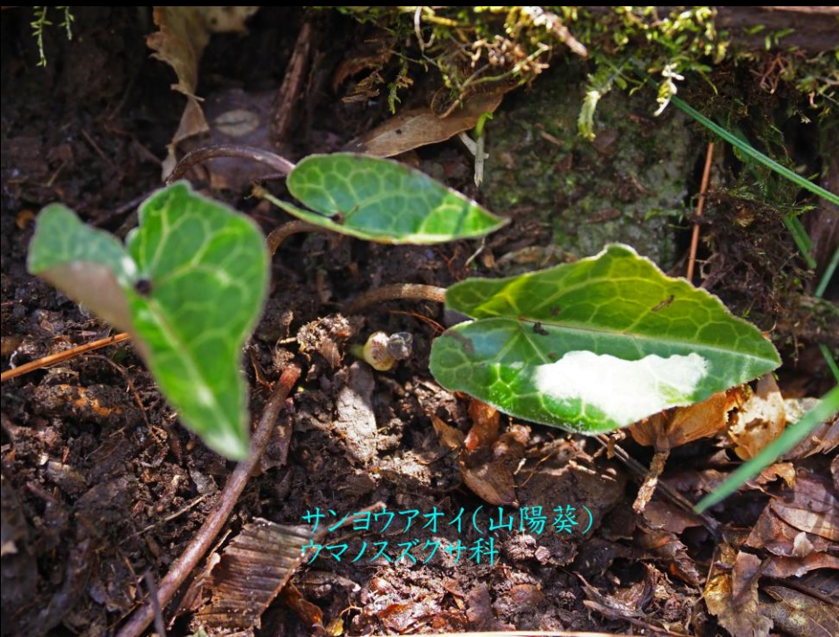
サンヨウアオイ(山陽葵) ウマノスズクサ科