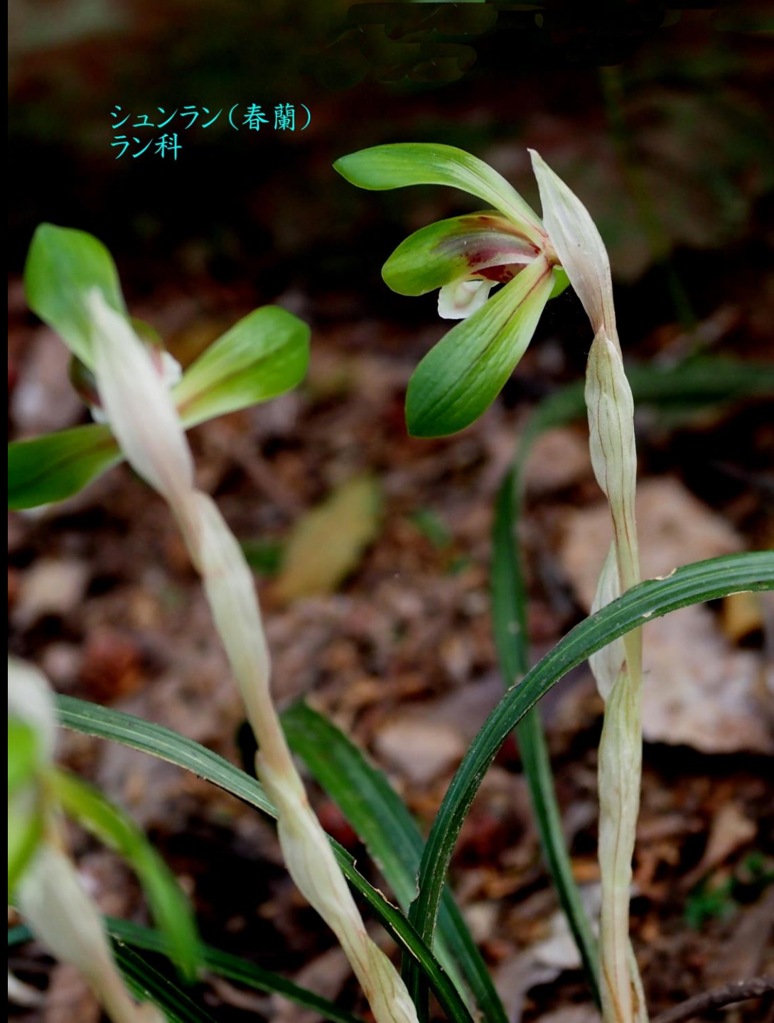
シュンラン(春蘭) ラン科