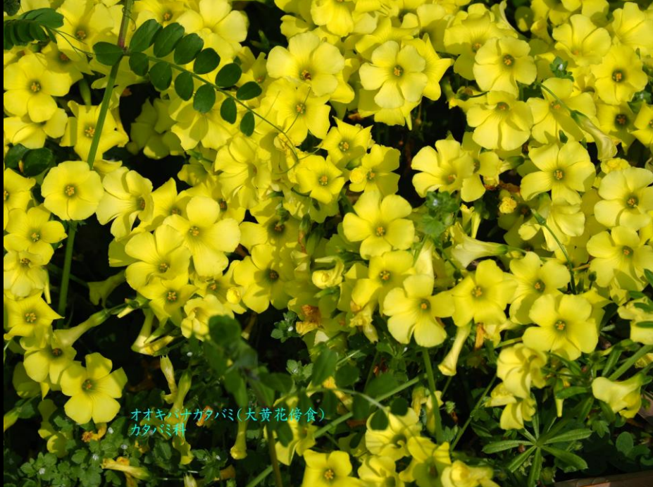
オオキハナカタバミ(大黄花傍食) カタバミ科