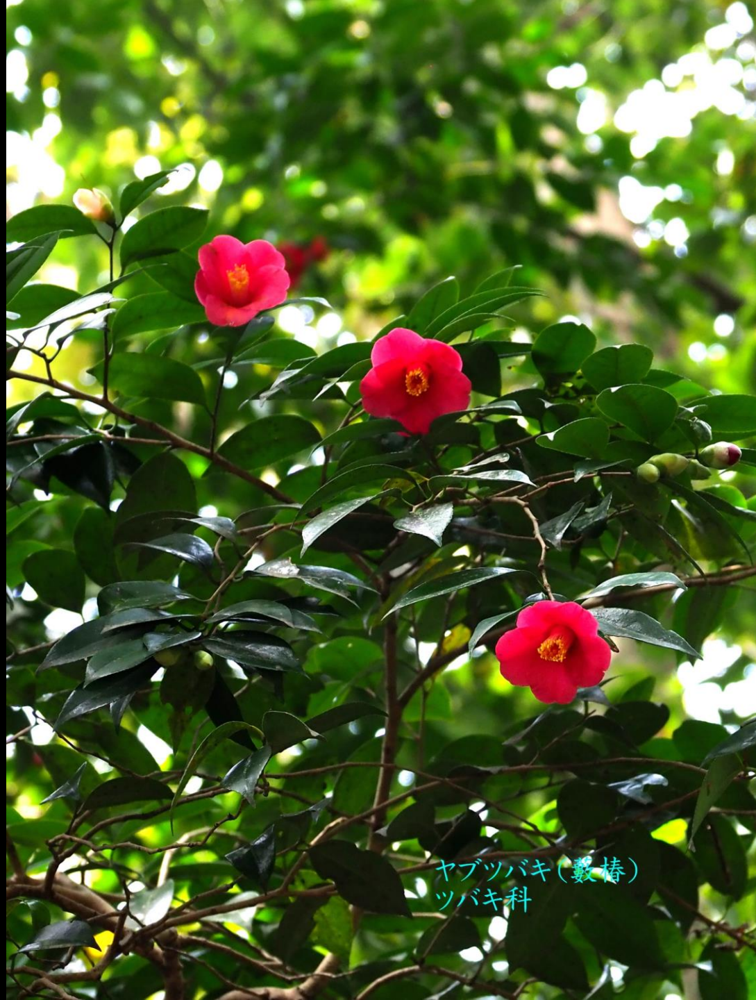
ヤブツバキ(數椿) ツバキ科