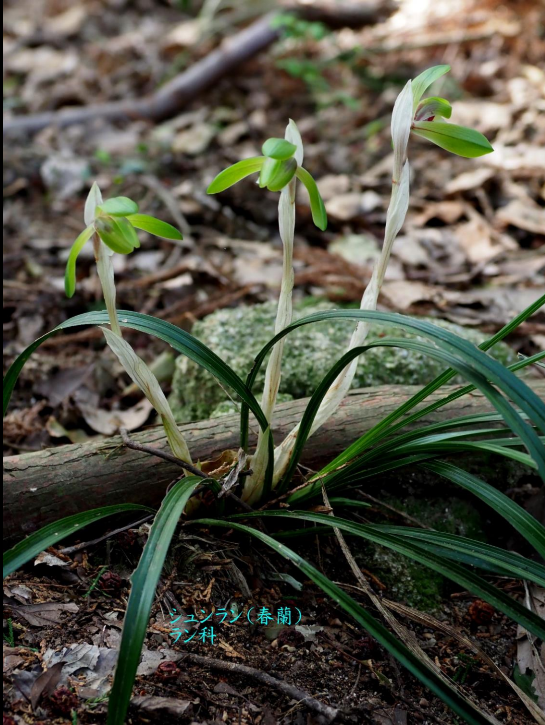
シュンラン(春蘭) ラン科