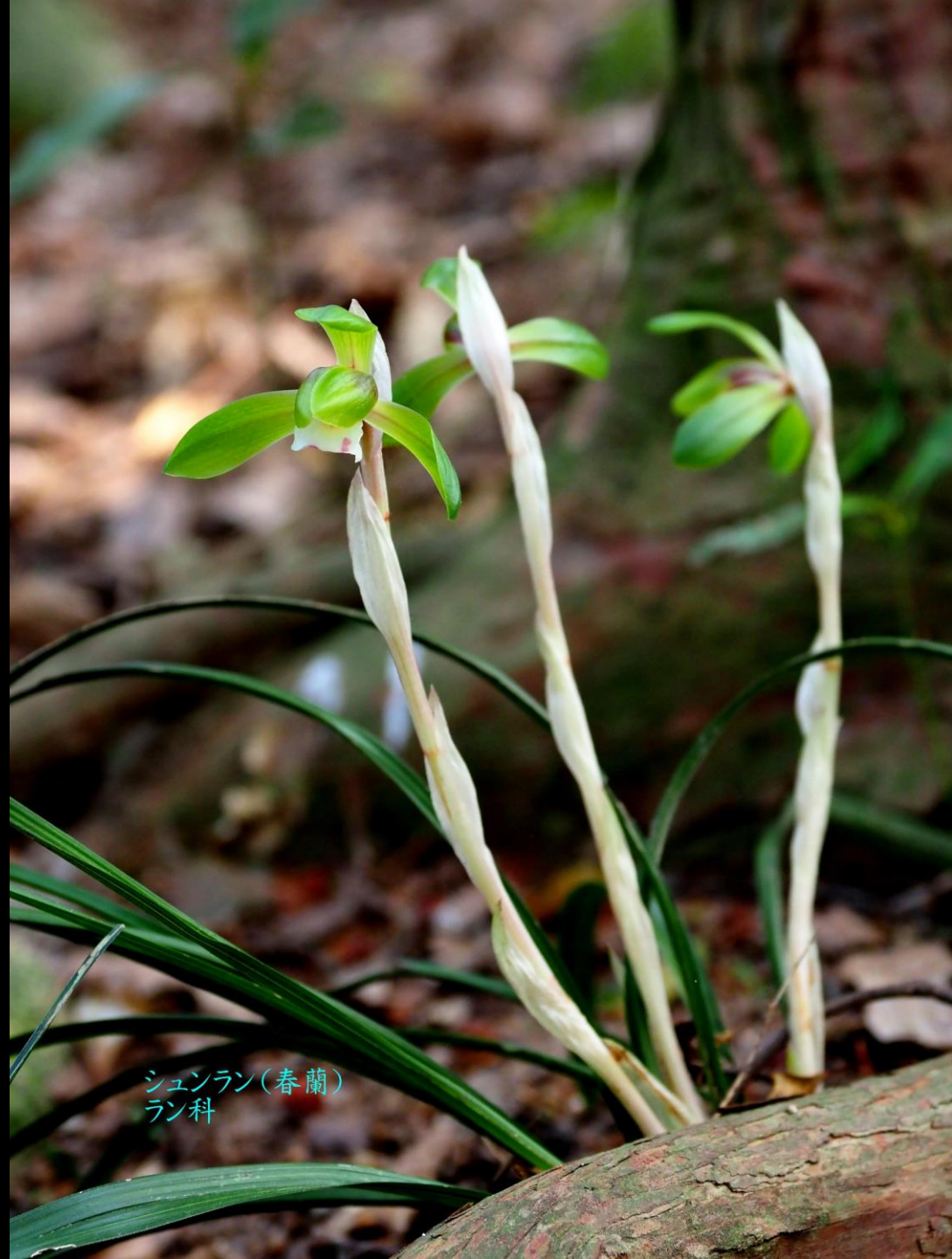
シュンラン(春蘭) ラン科