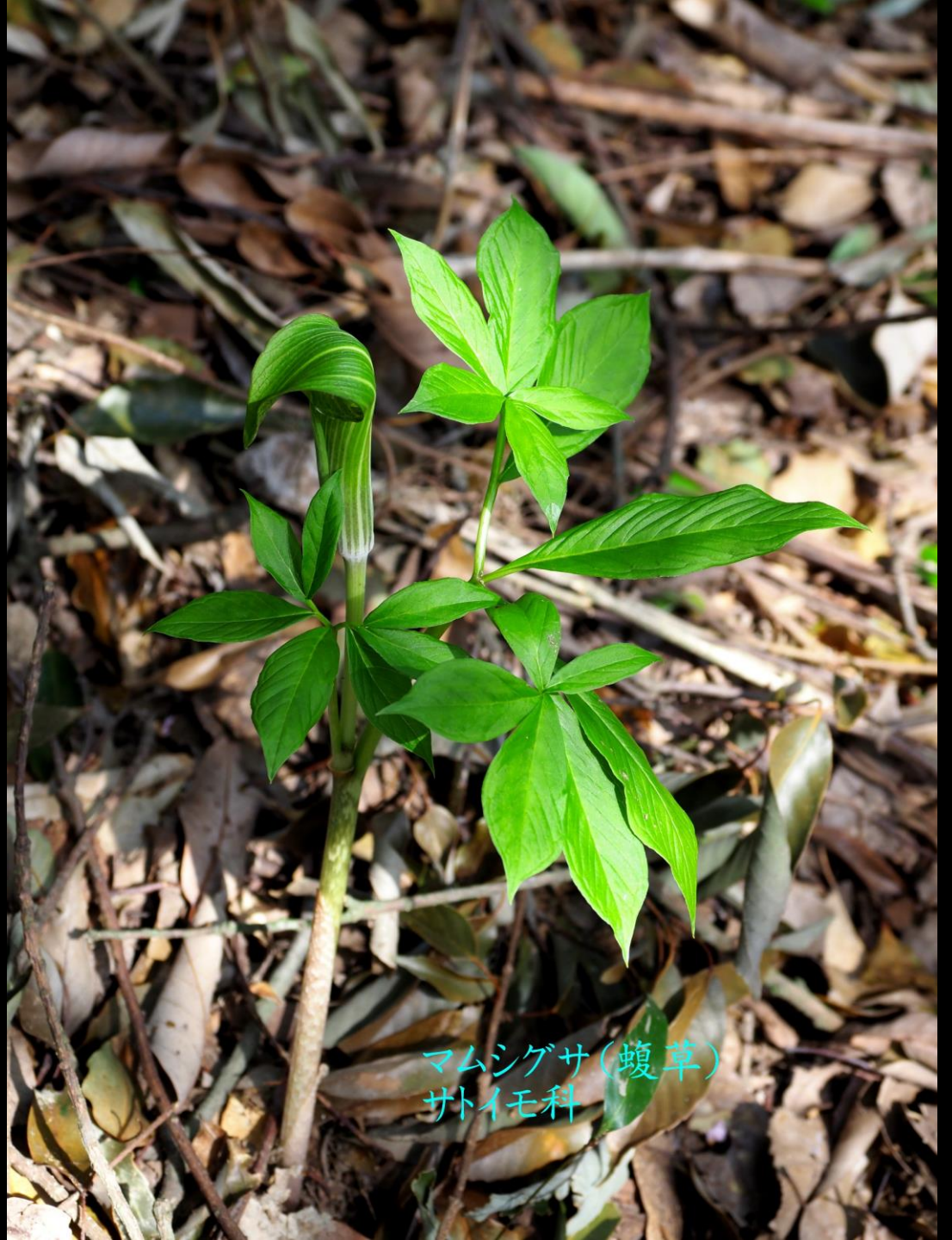
マムシゲサ(蝮草) サトイモ科