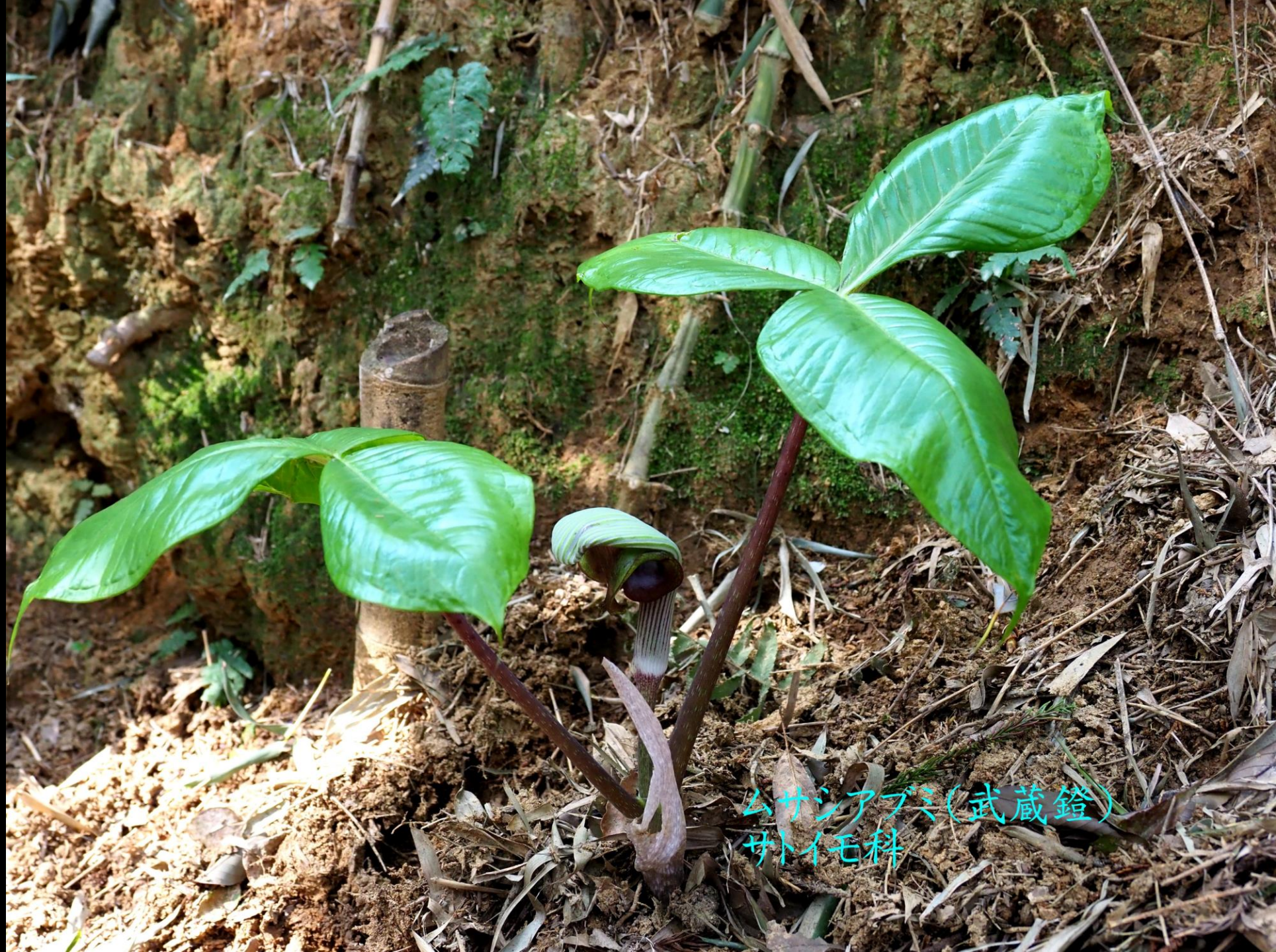
ムサシアブミ(武蔵鎧) サトイモ科