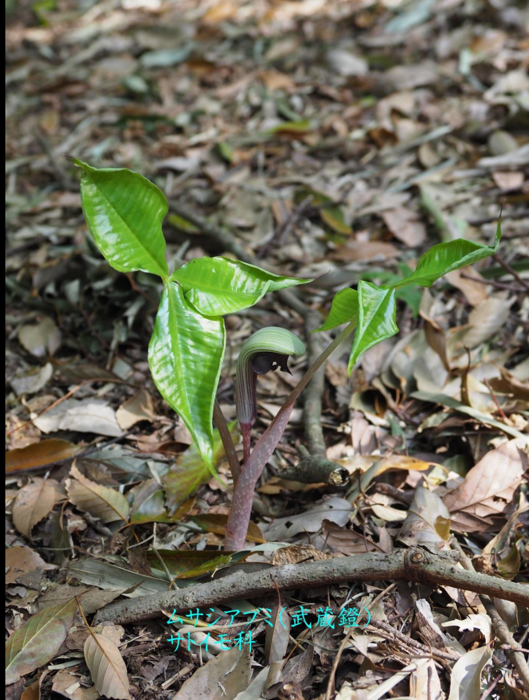
ムサシアブミ(武蔵鐘) サトイモ科