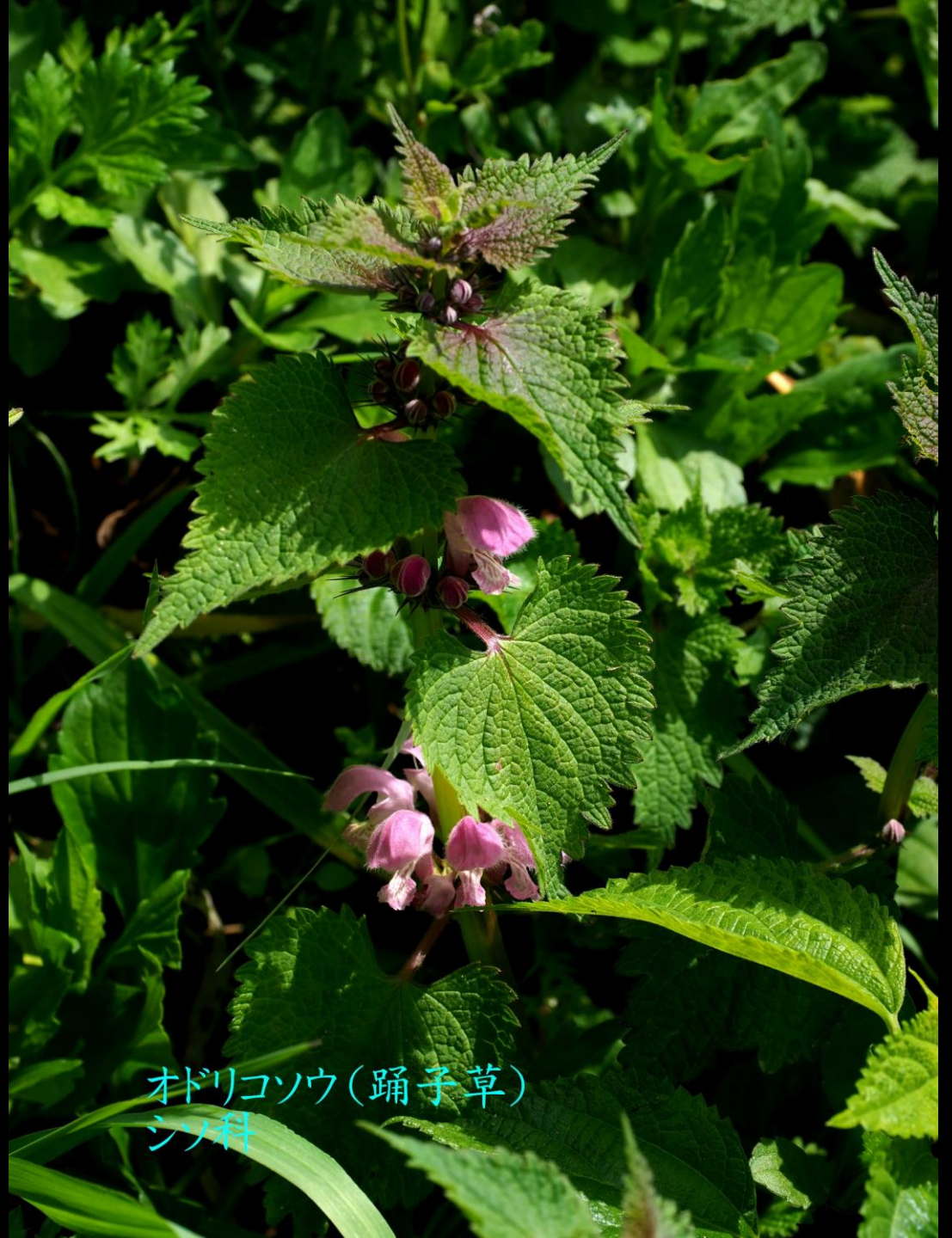
オドリコソウ(踊子草) シソ科