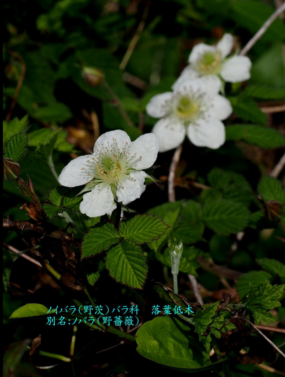
ノイバラ(野茨)バラ科 落葉低木 別名:ノバラ(野薔薇)