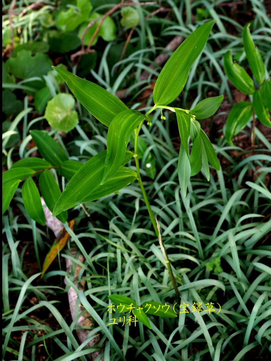
ホウチャクソウ(宝鐸草) ユリ科