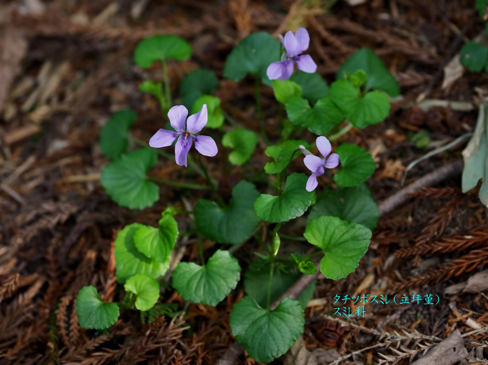
タチツボスミレ(立坪堇) スミレ科