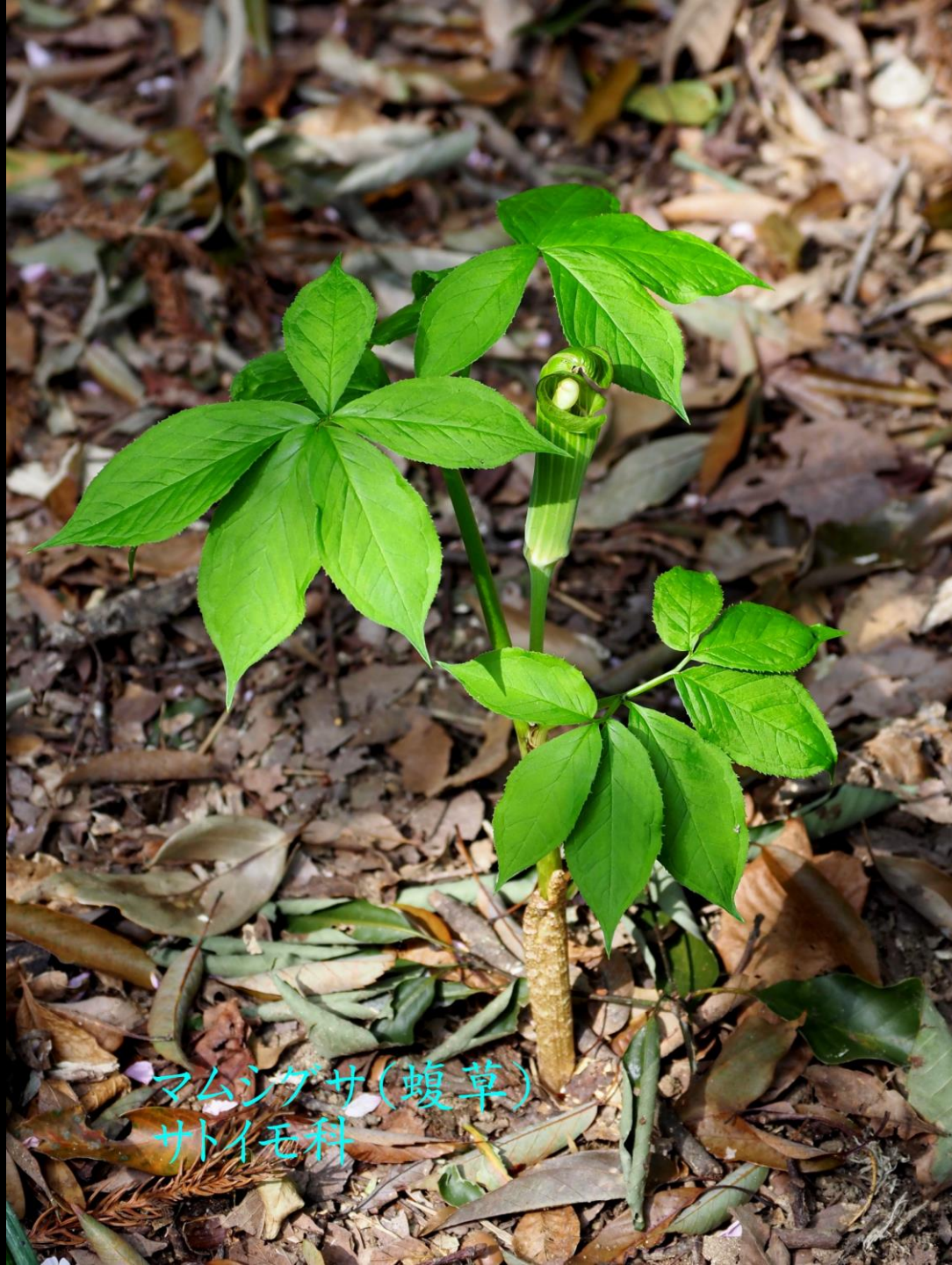
マムシゲサ(蝮草) サトイモ科