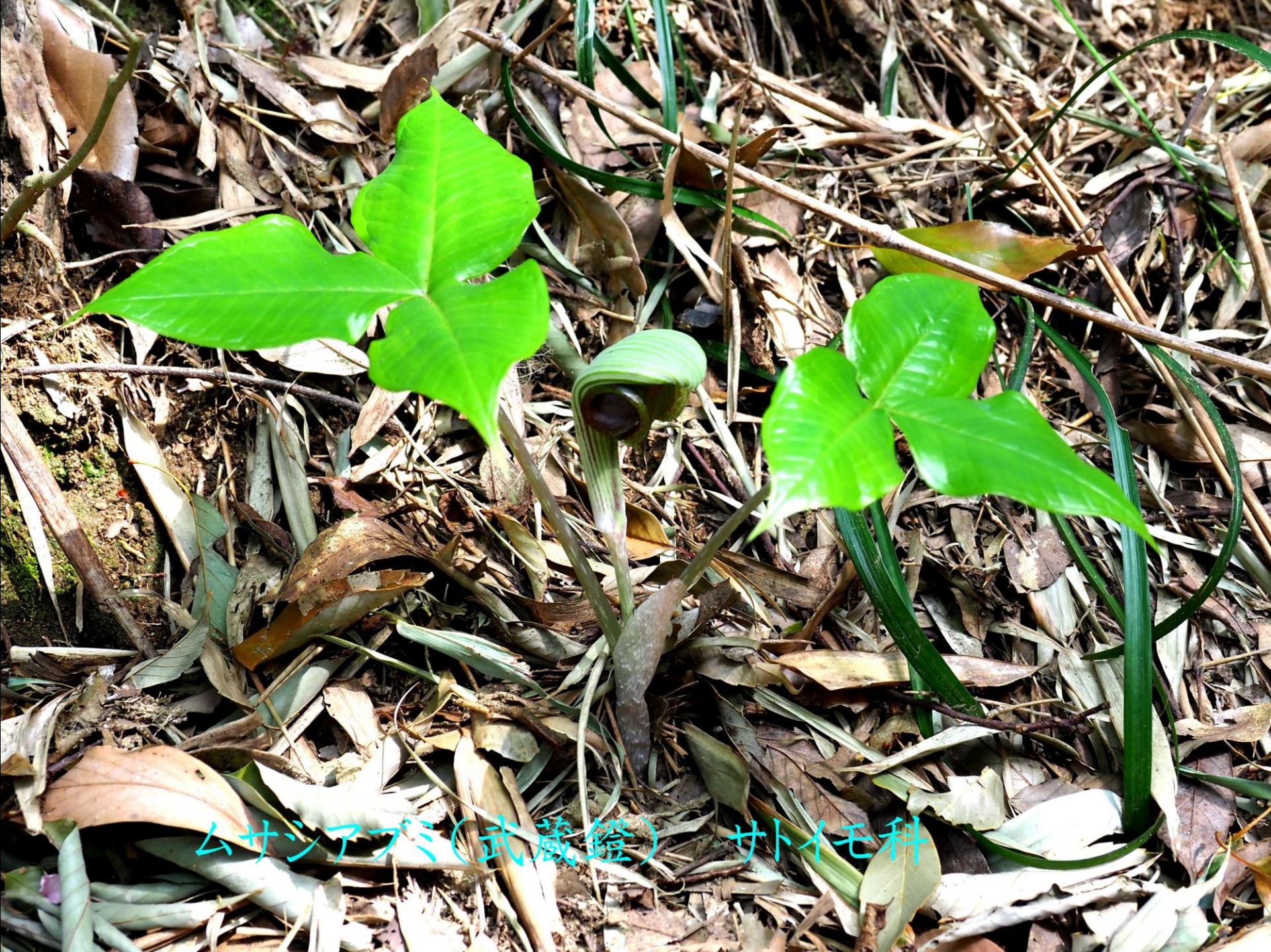
ムサシアブミ(武蔵鐙) サトイモ科