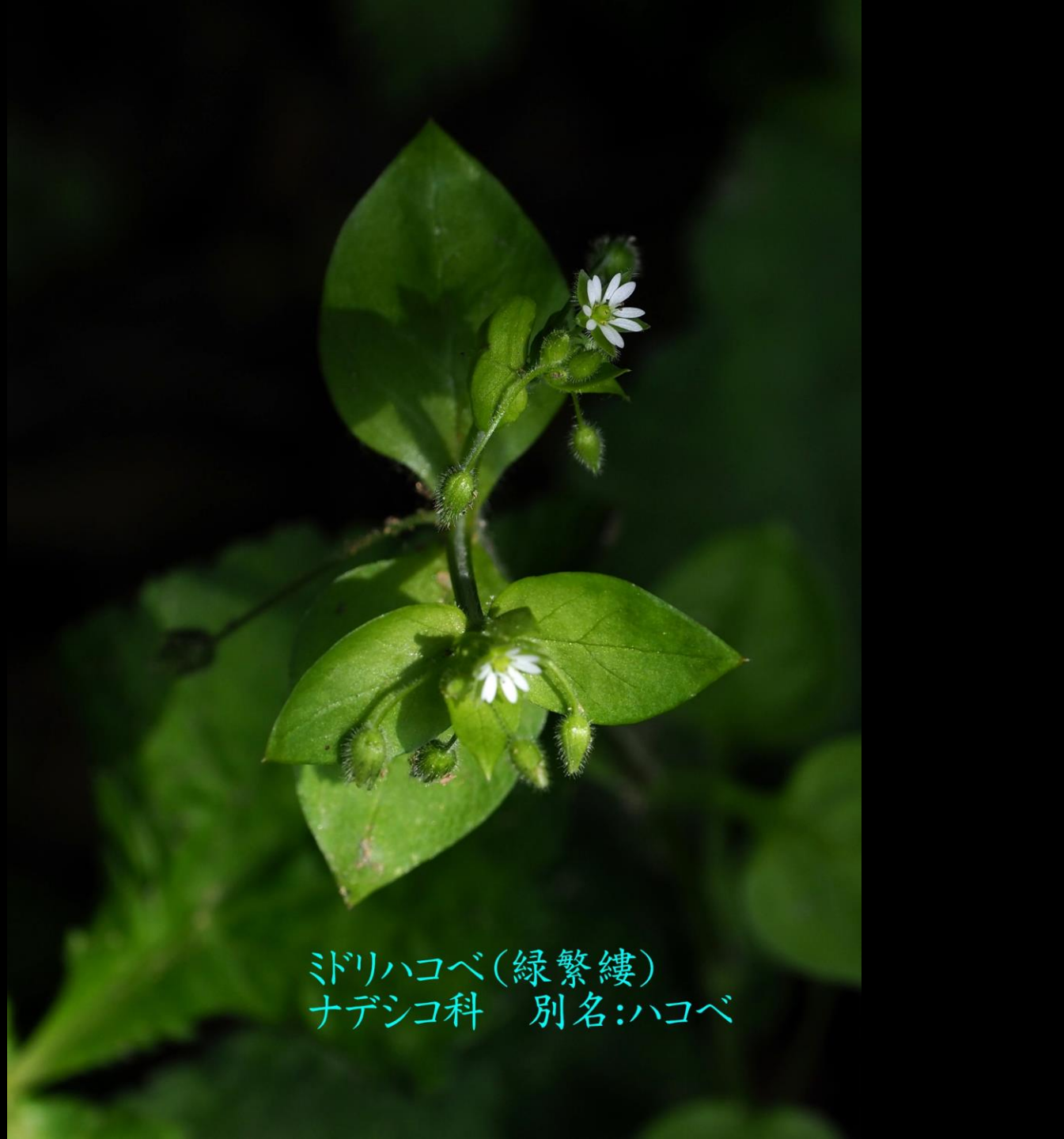
ミドリハコベ(緑繁縷) ナデシコ科 別名:ハコベ