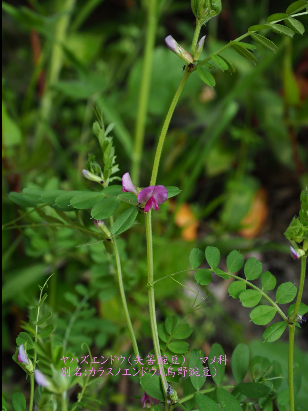
ヤバズエンドウ(矢筈豌豆) マメ科 別名:カラスノエンドウ(烏野豌豆)