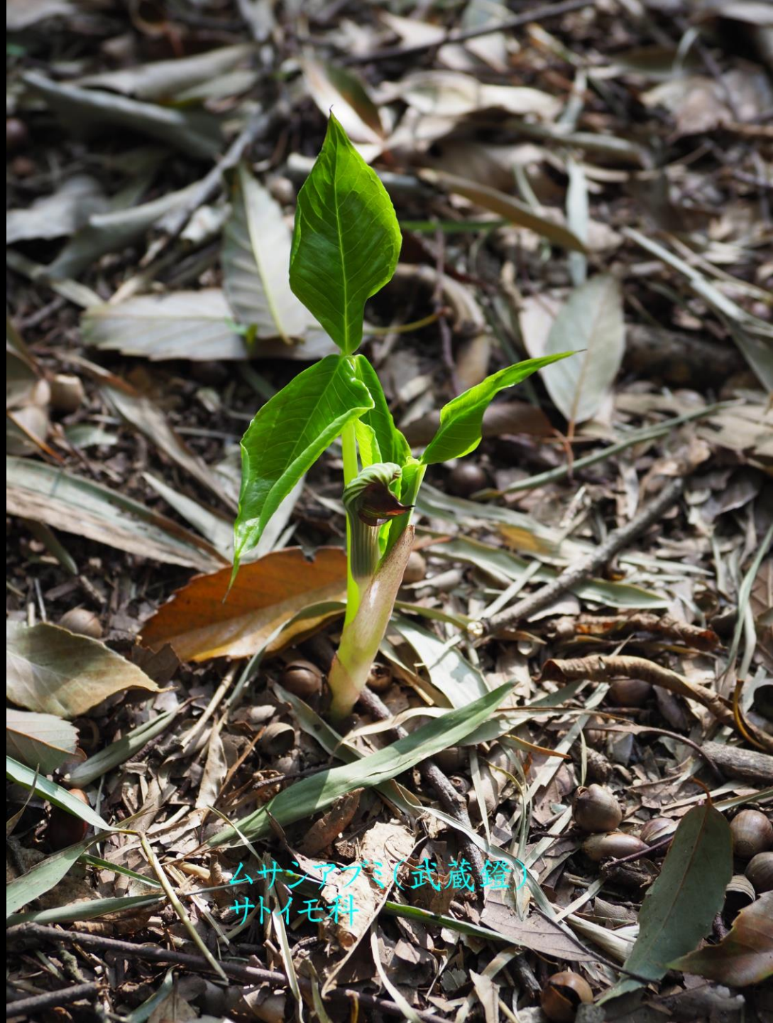
ムサシアブミ(武蔵鐘) サトイモ科