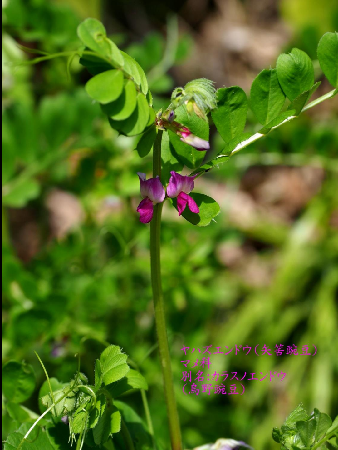
ヤハズエンドウ(矢筈豌豆) マメ科 別名:カラスノエンドウ (烏野豌豆)