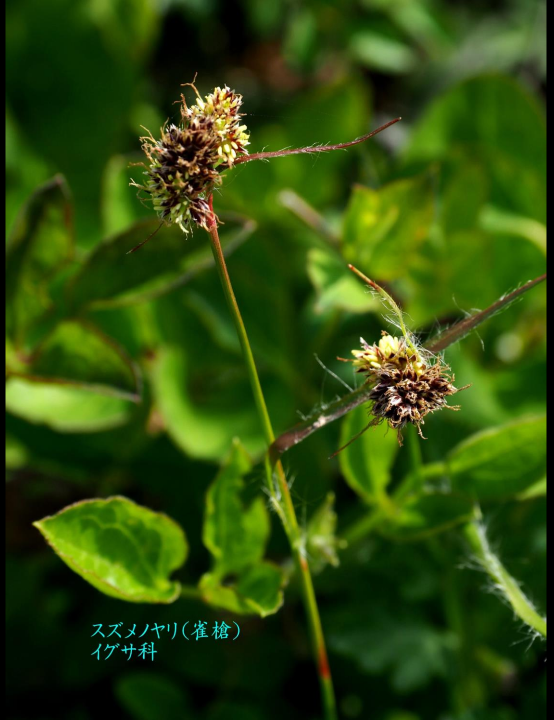
スズメノヤリ(雀槍) イグサ科