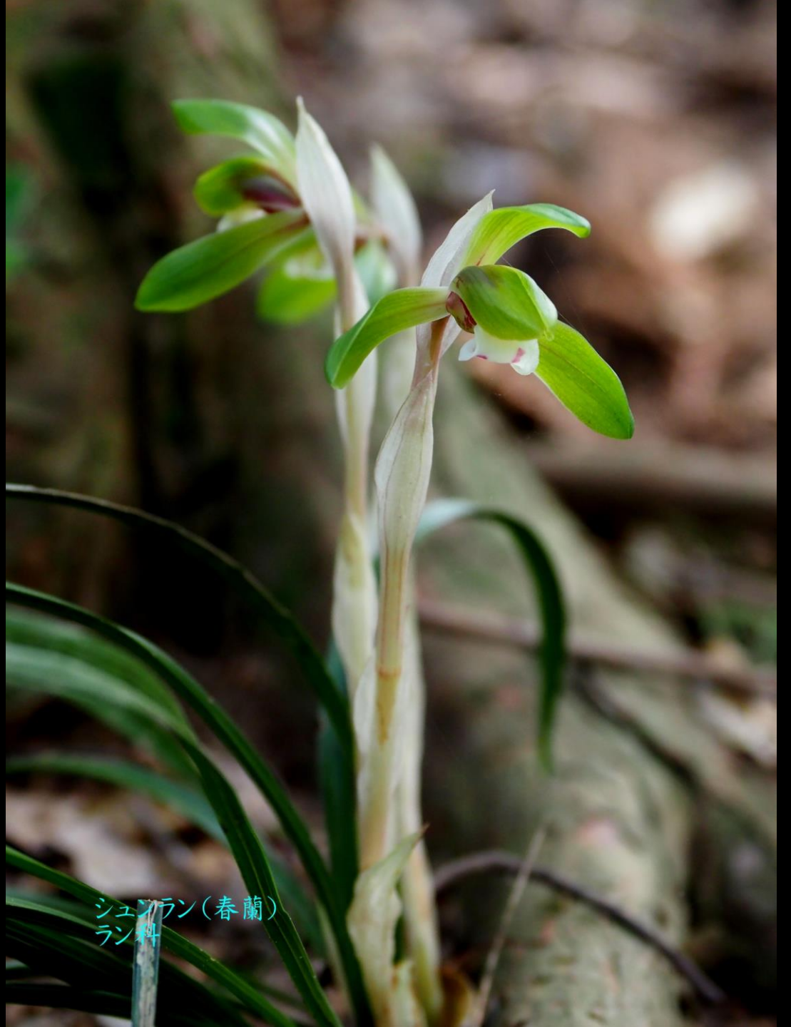
シュンラン(春蘭) ラン科