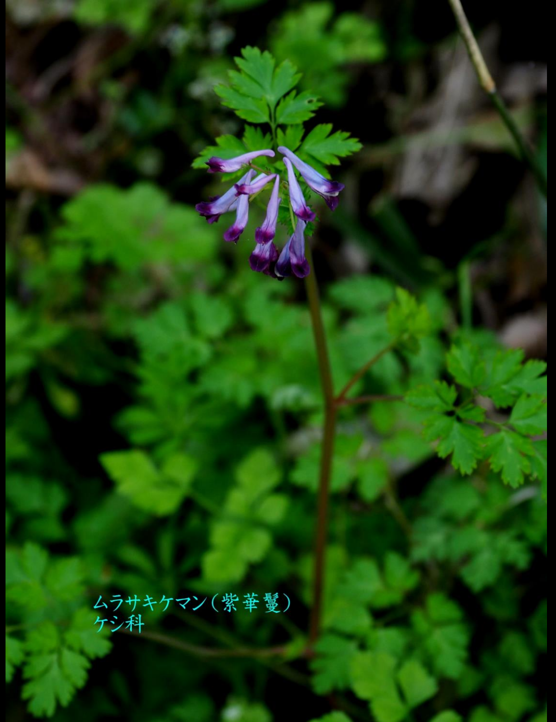
ムラサキケマン(紫華鬘) ケシ科