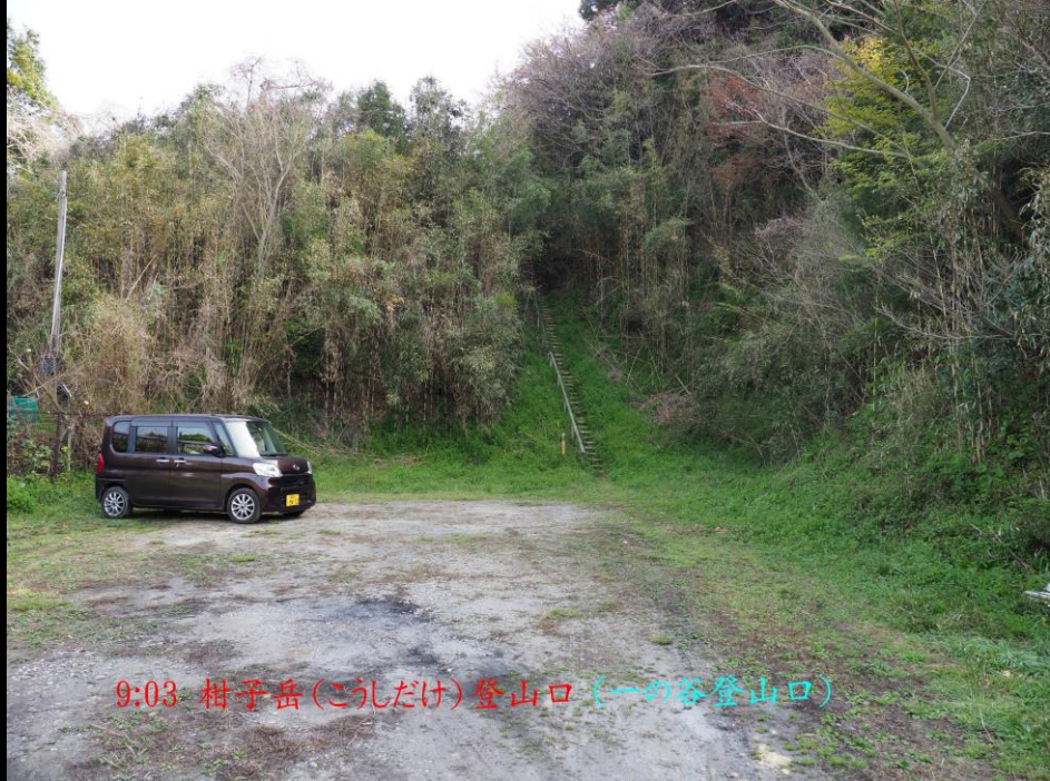
9:03 柑子岳(こしだけ)登山口(一の谷登山口)