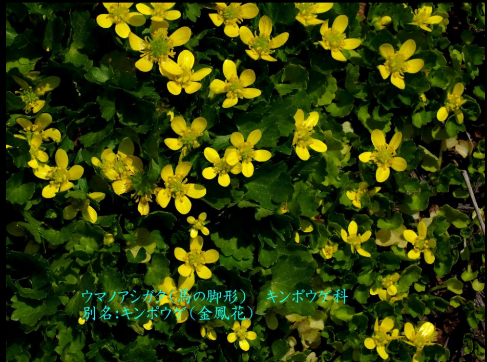
ウマノアシガタ(馬の脚形) キンポウゲ科 別名:キンポウゲ(金鳳花)