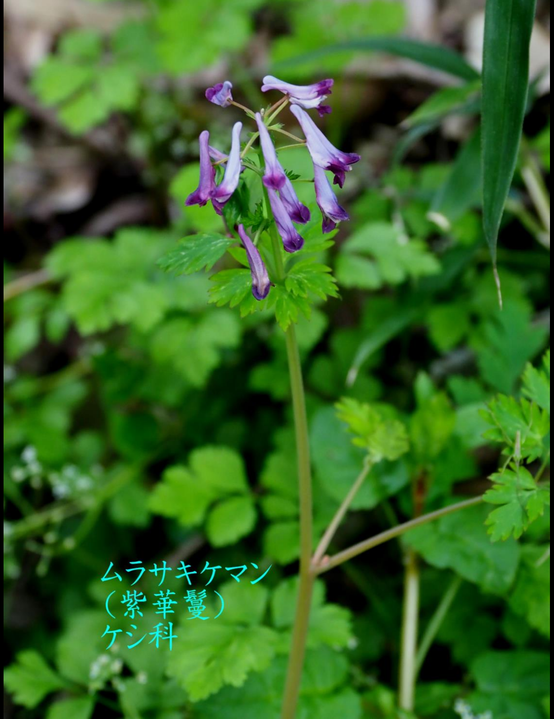
ムラサキケマン (紫華鬘) ケシ科