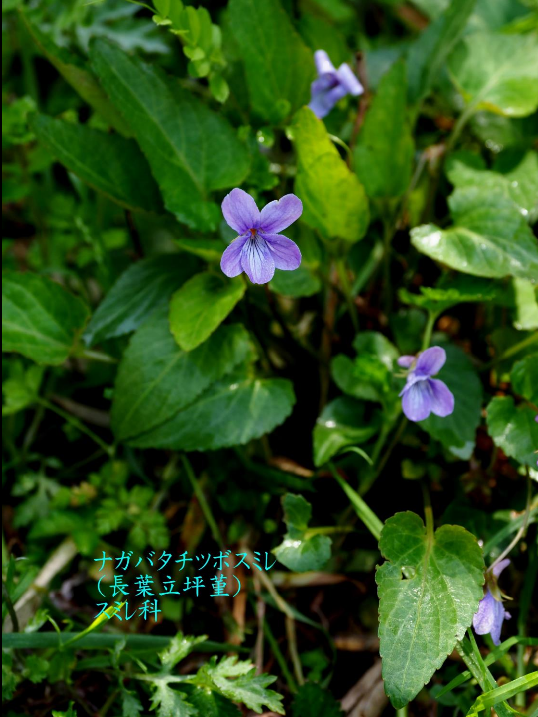
ナガバタチツボスミ (長葉立坪堇) スミ科