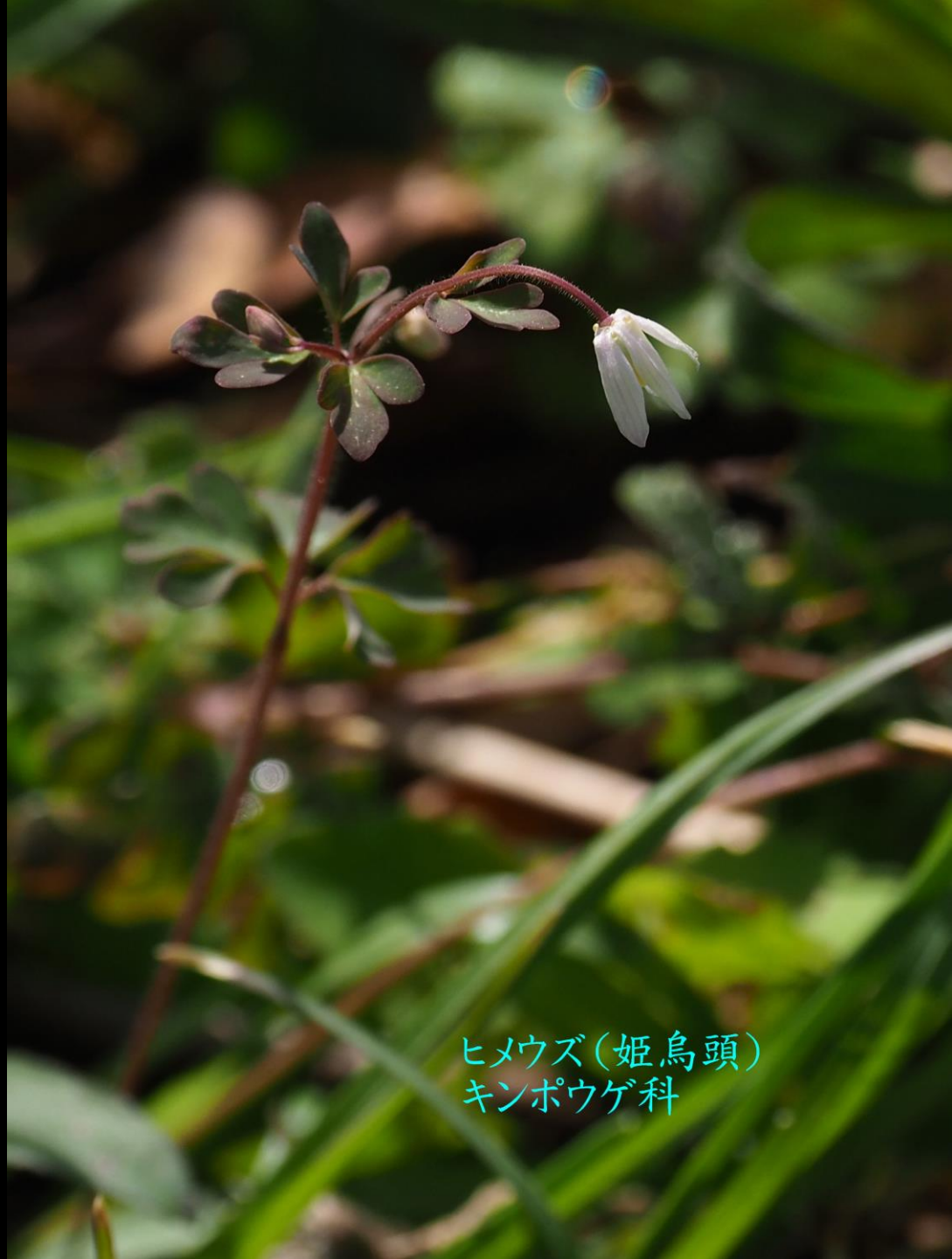
ヒメウズ(姫烏頭) キンポウゲ科