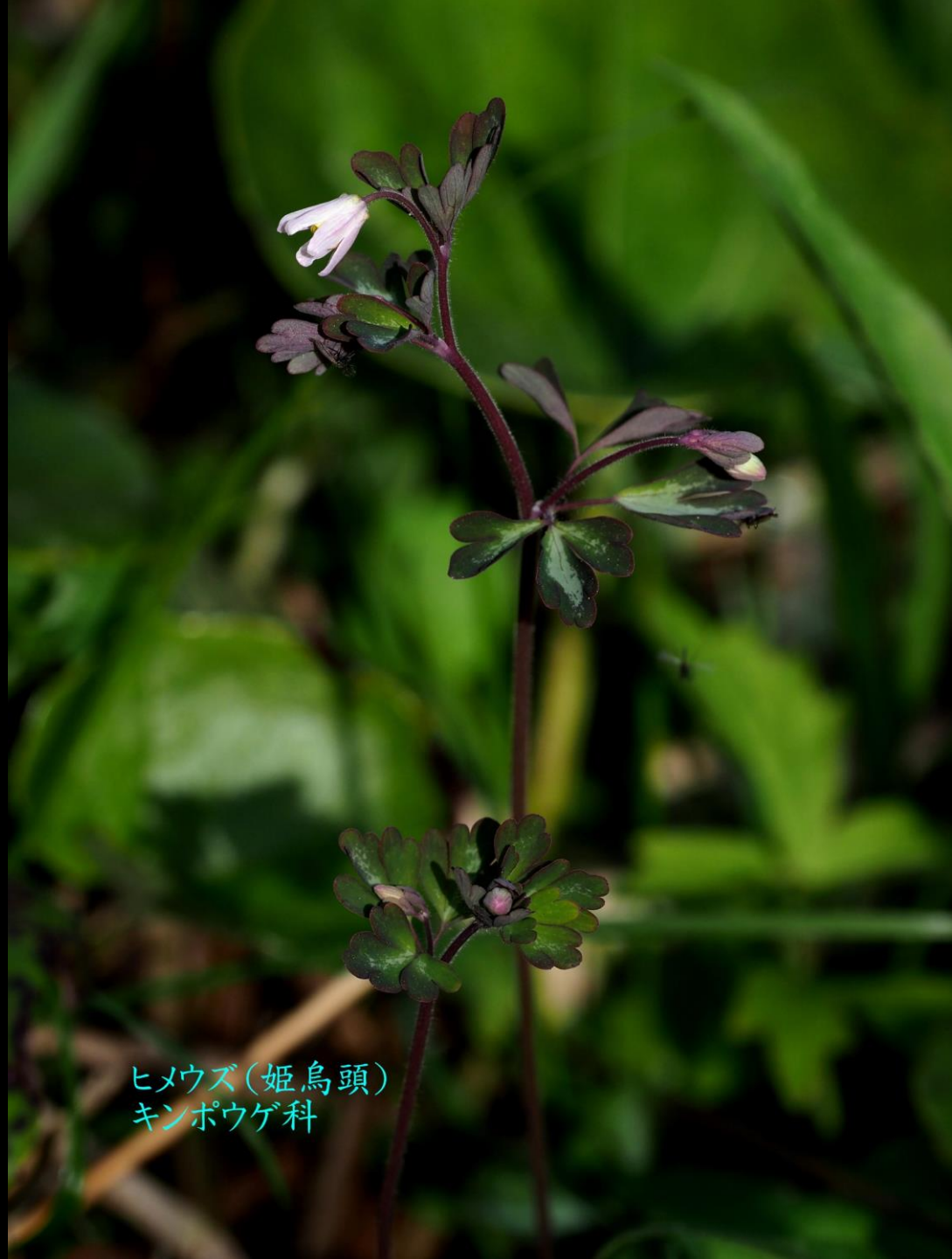
ヒメウズ(姫烏頭) キンポウゲ科