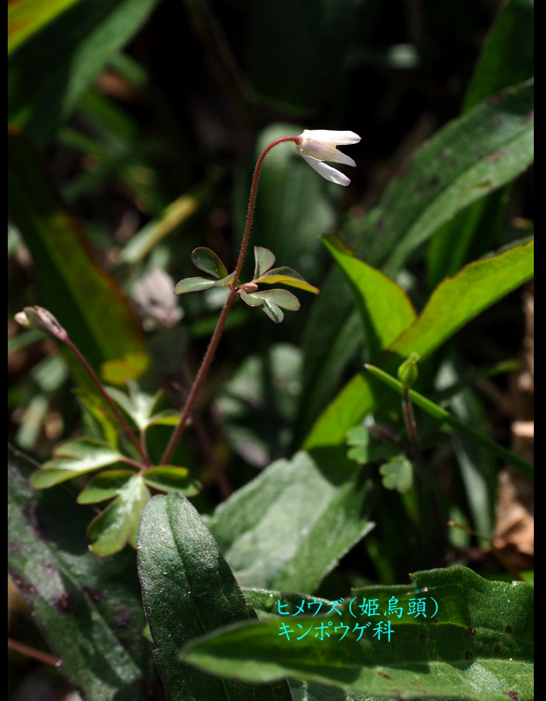
ヒメウズ(姫烏頭) キンポウゲ科