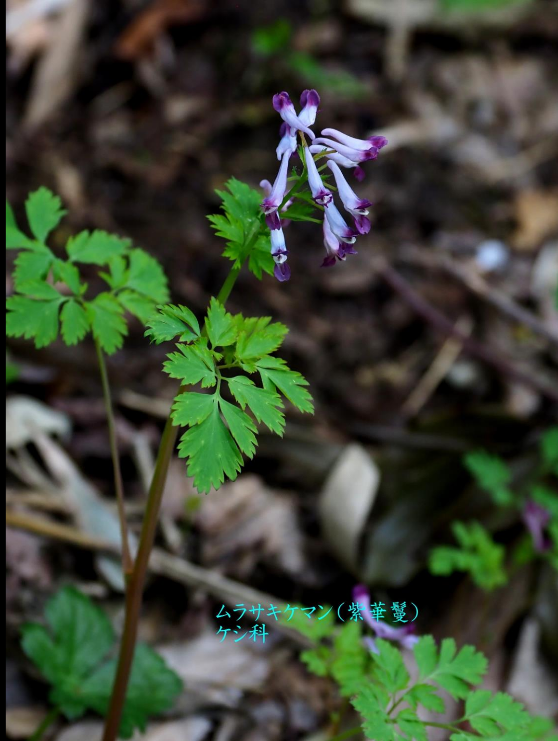
ムラサキケマン(紫華鬘) ケシ科