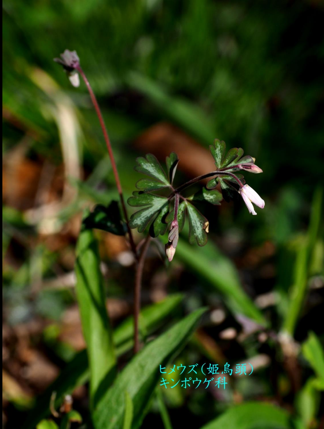
ヒメウズ(姫烏頭) キンポウゲ科