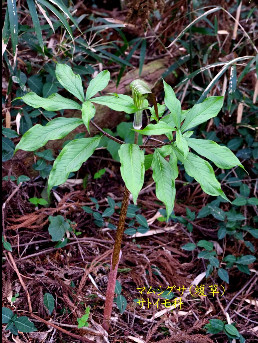
マムシグサ(蝮草) サトイモ科