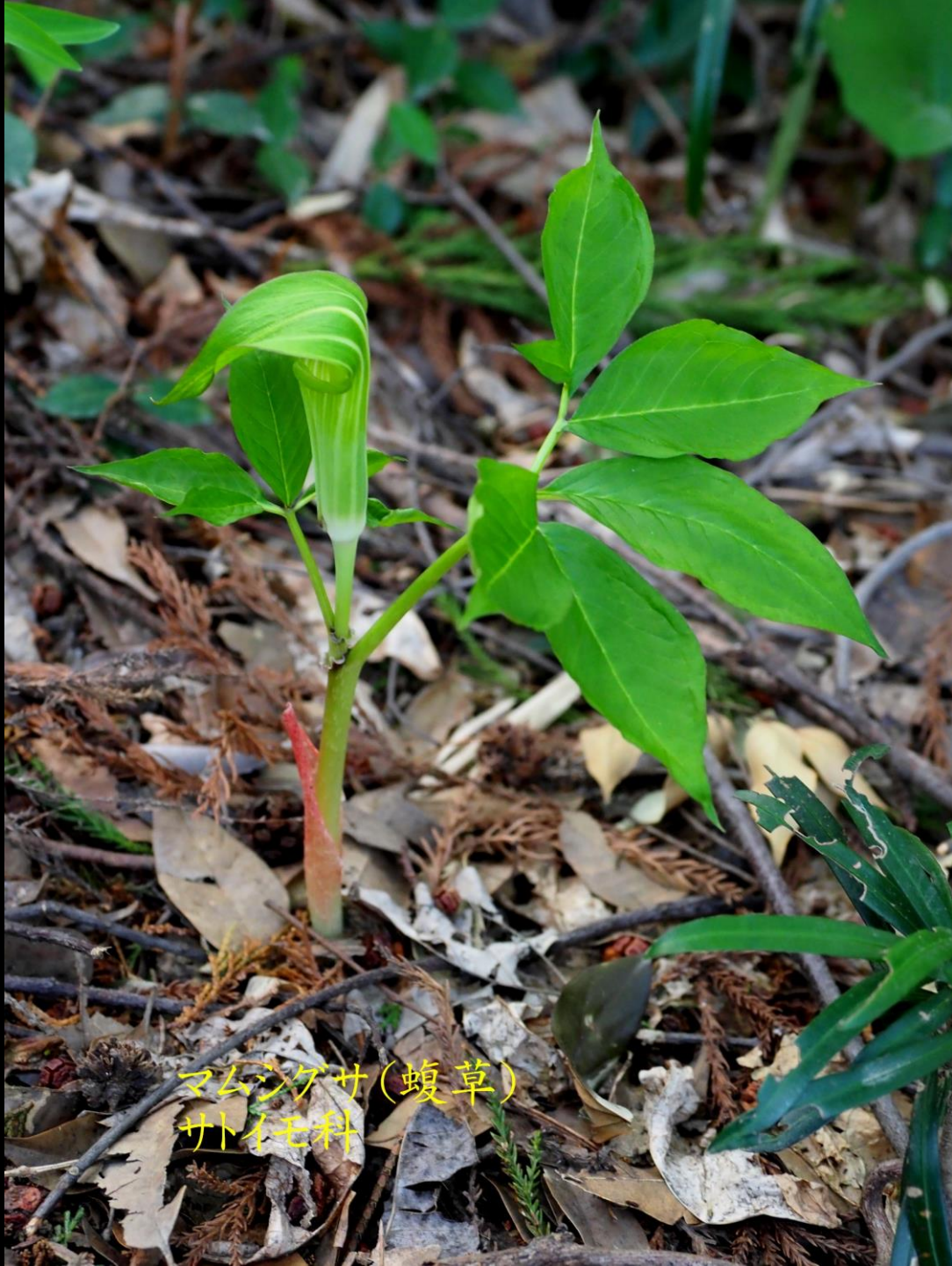
マムシグサ(蝮草) サトイモ科