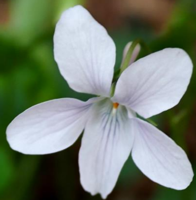
シロバナタチツボスミレ (白花立坪堇) スミレ科