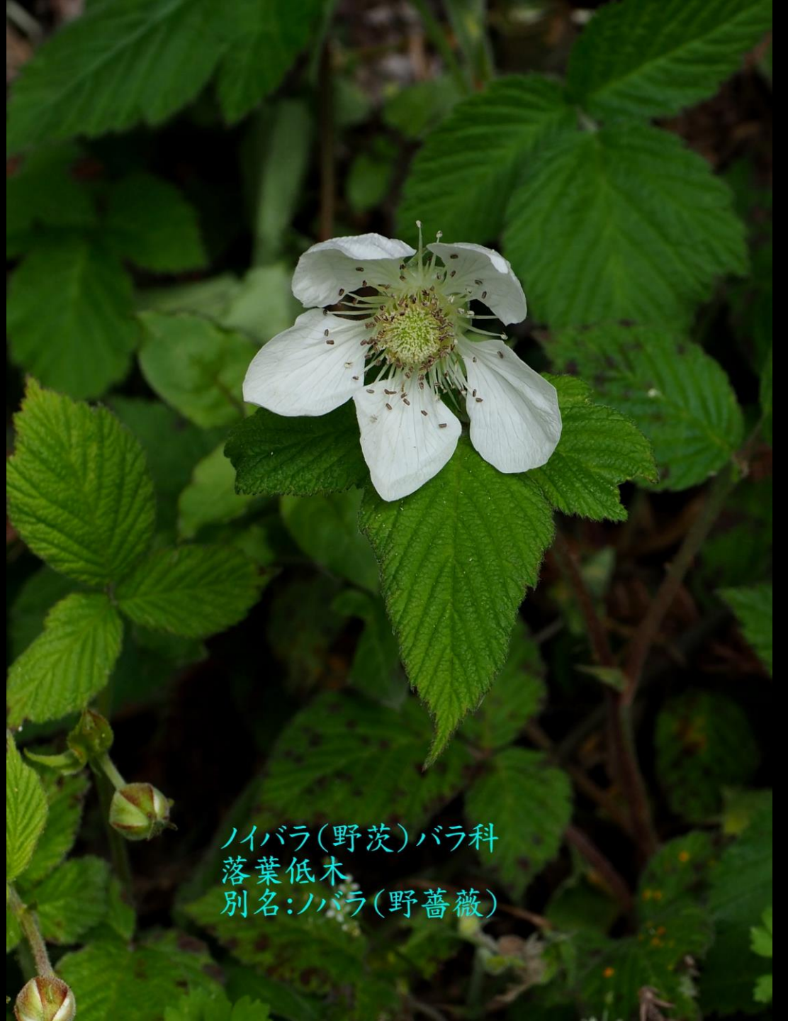
ノイバラ(野茨)バラ科 落葉低木 別名:ノバラ(野薔薇)