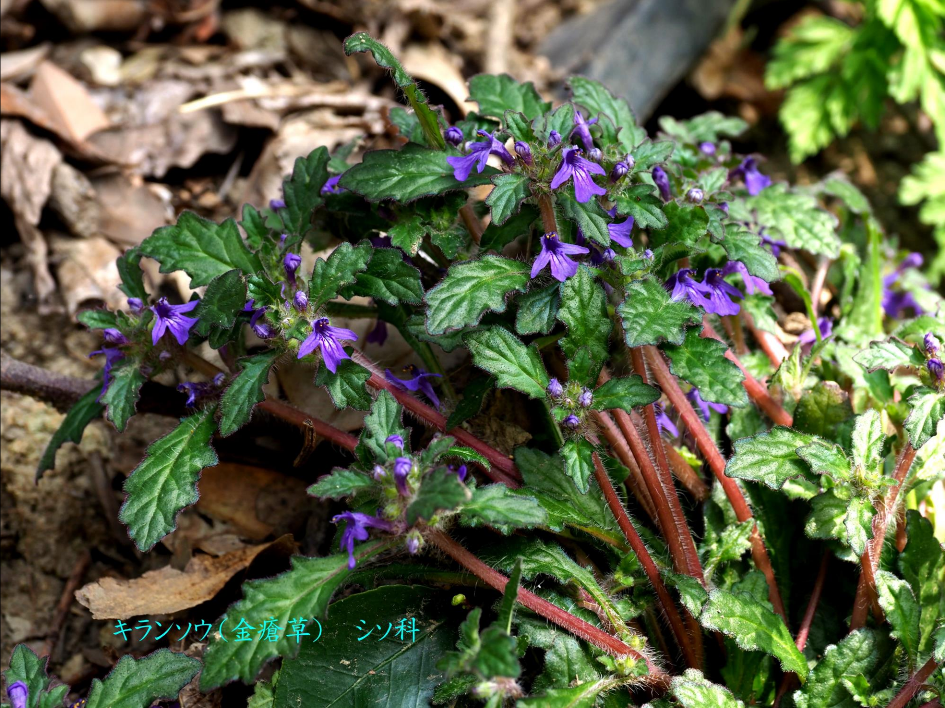
キラソウ(金瘡草) シソ科