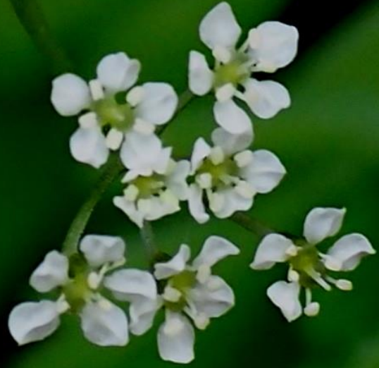
セントウソウ (仙洞草、洗湯草) セリ科