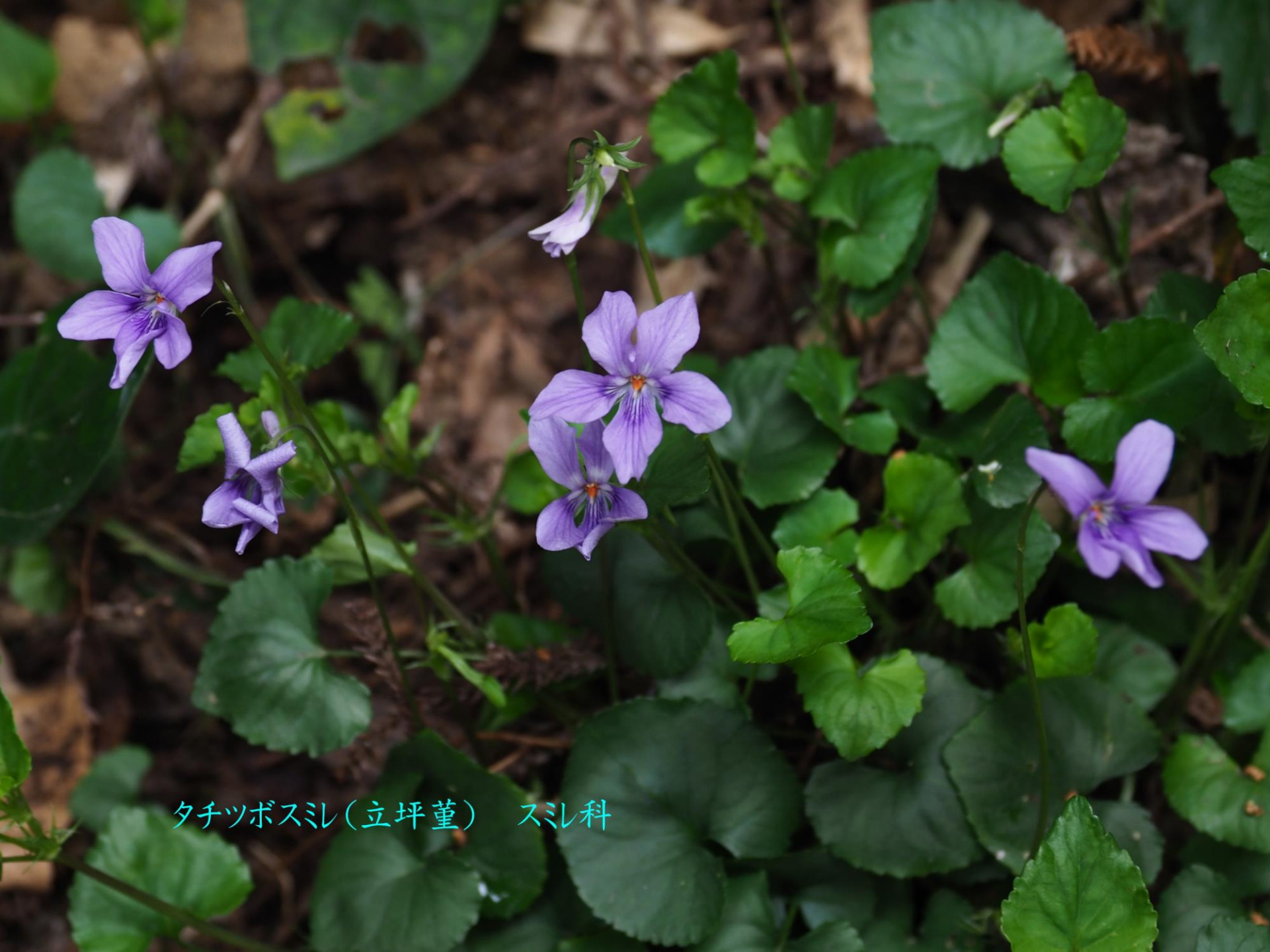
タチツボスミ(立坪堇) スミ科