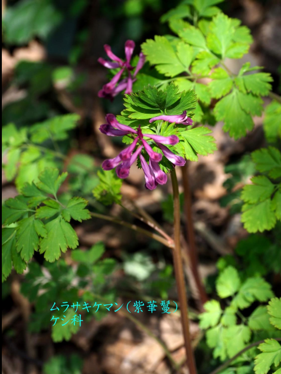
ムラサキケマン(紫華鬘) ケシ科