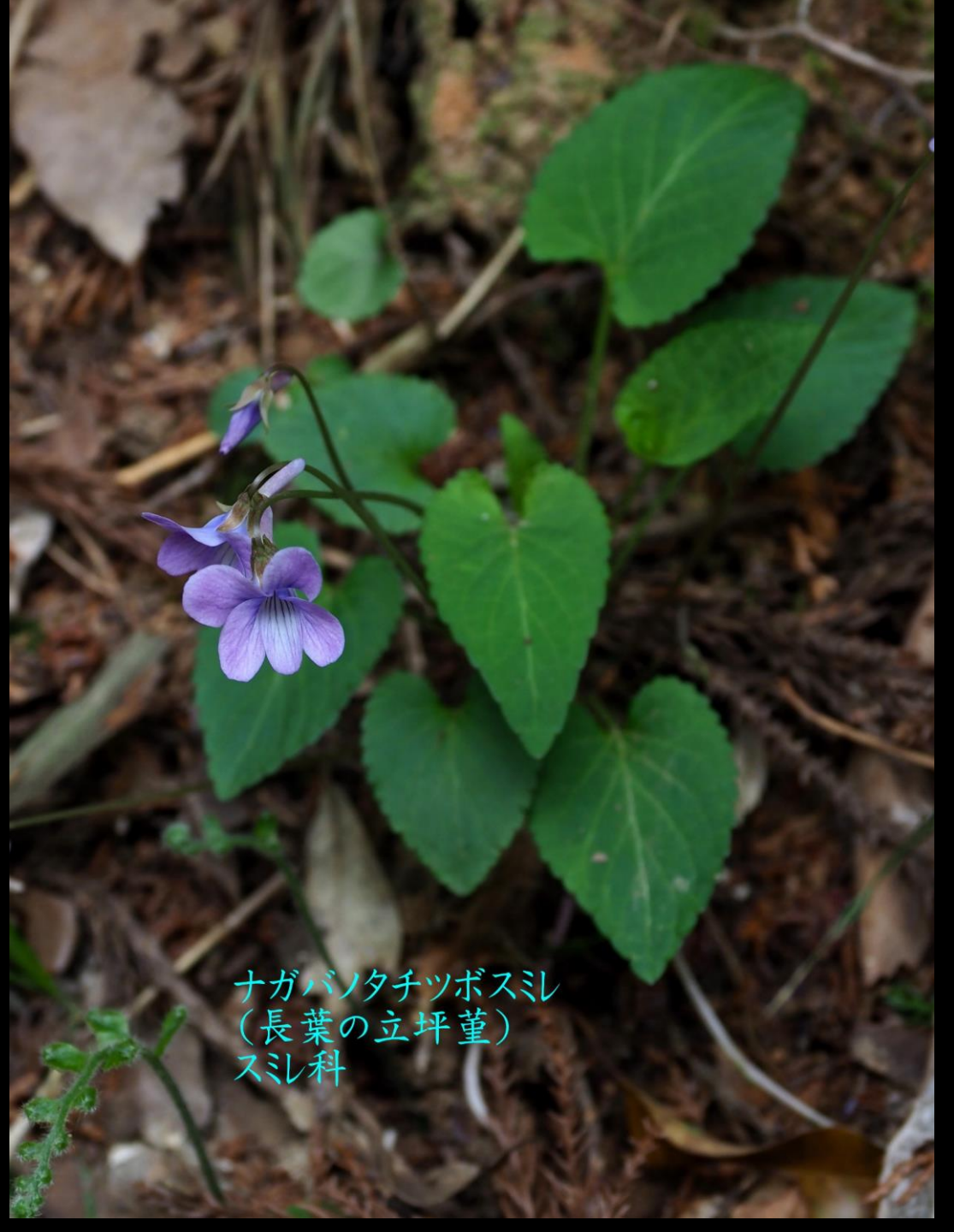
ナガバナタチツボスミレ (長葉の立坪堇) スミレ科