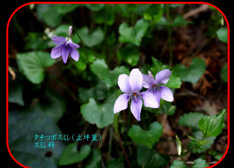
タチツボスミレ(立坪堇) スミレ科