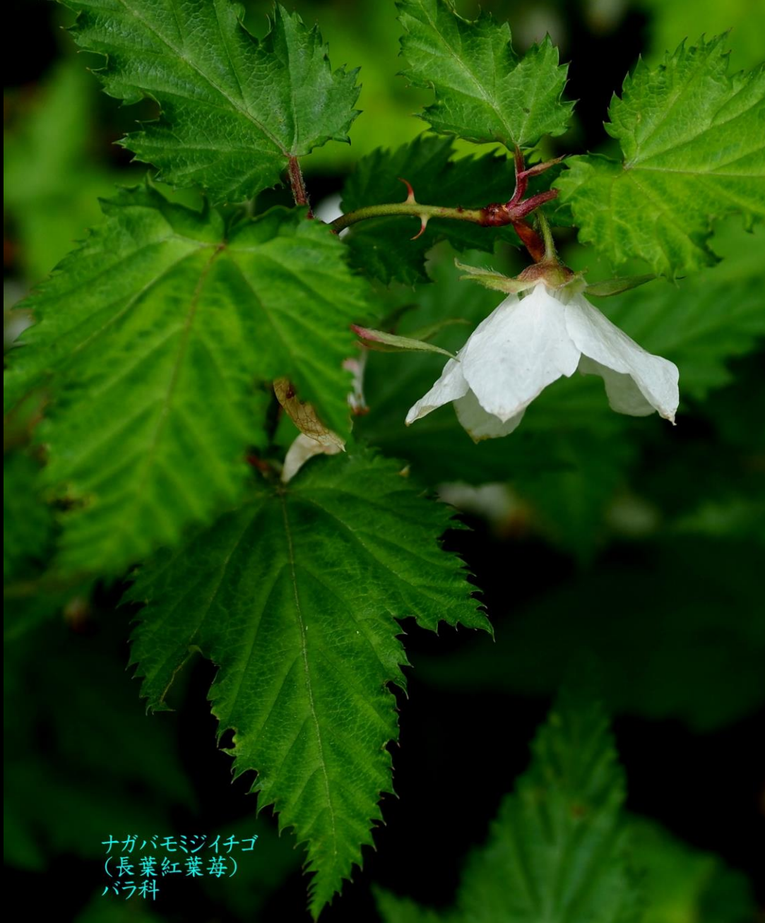
ナガバモミジイチゴ (長葉紅葉莓) バラ科