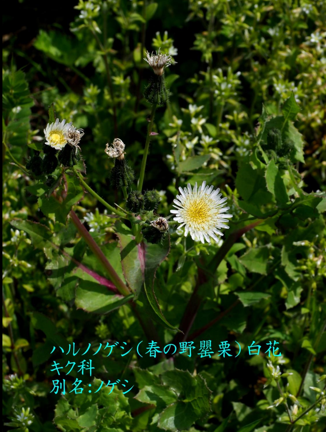
ハルノゲシ(春の野罌粟)白花 キク科 別名:ノゲシ