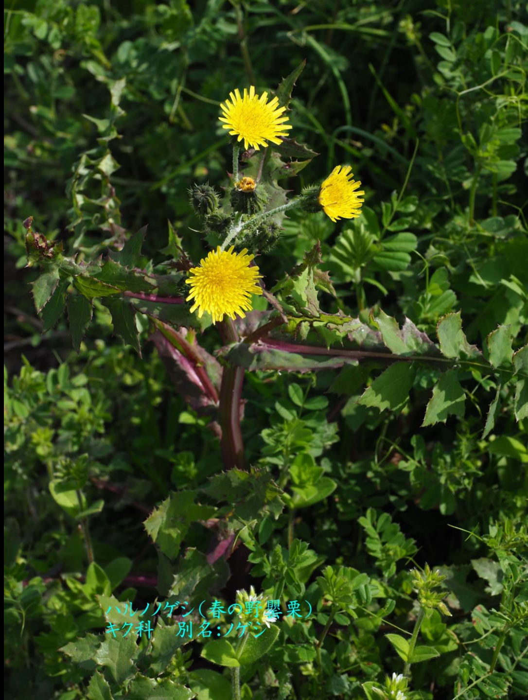
ハルノゲシ(春の野罌粟) キク科 別名:ノゲシ