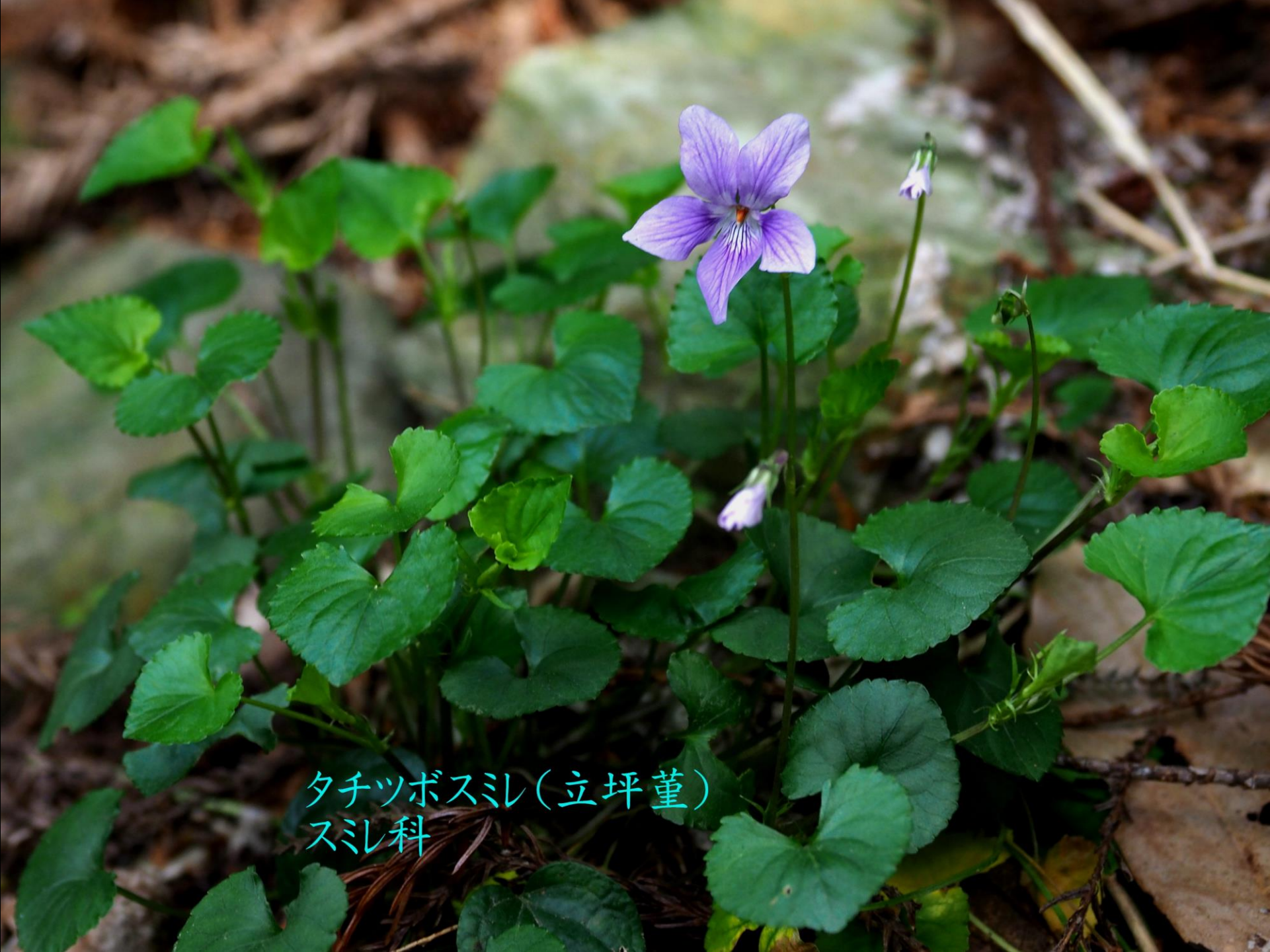
タチツボスミレ(立坪堇) スミレ科