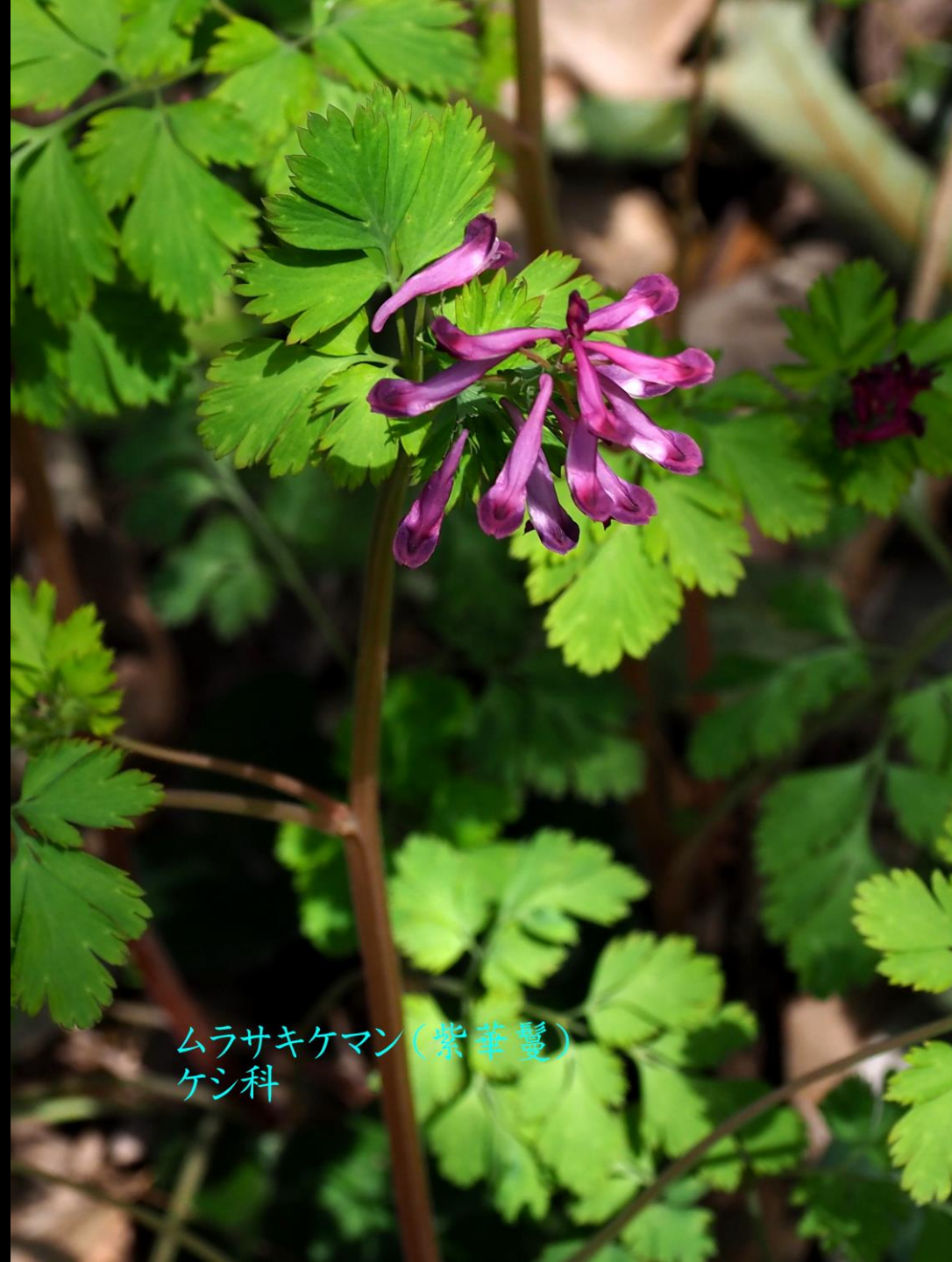
ムラサキケマン(紫華鬘) ケシ科