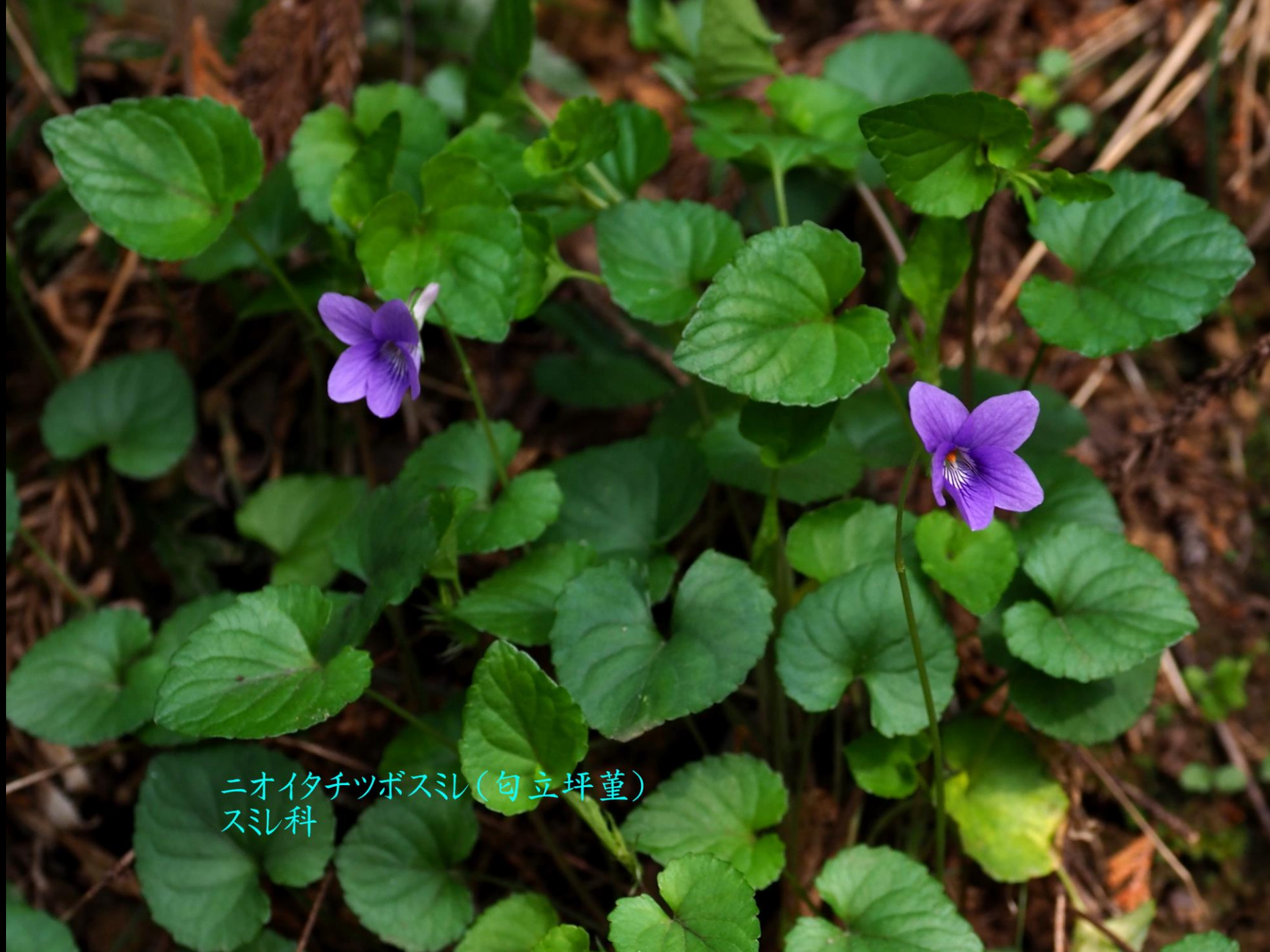
ニオイタチツボスミ(匂立坪堇) スミ科