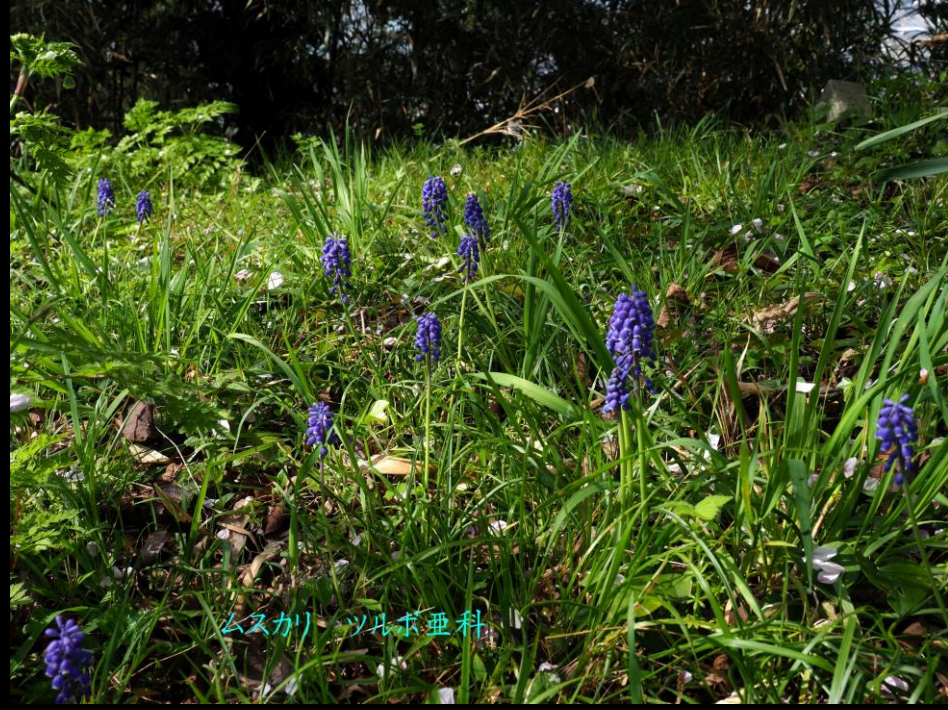
ムスカリ ツルボ亜科