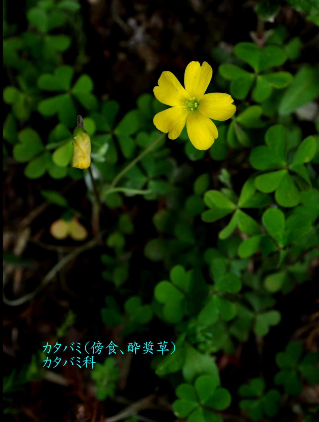
カタバミ(傍食、酔糞草) カタバミ科