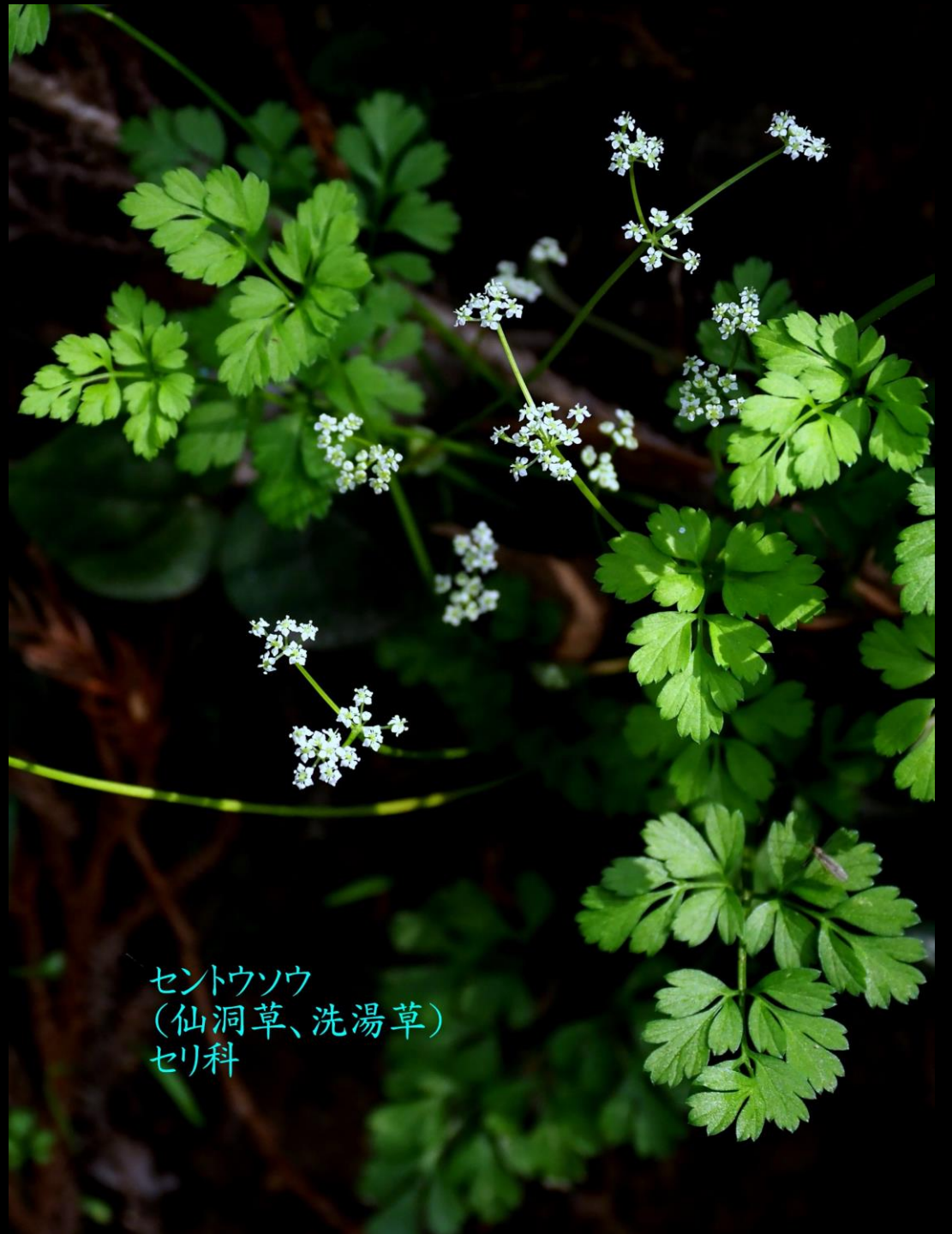
セントウソウ (仙洞草、洗湯草) セリ科