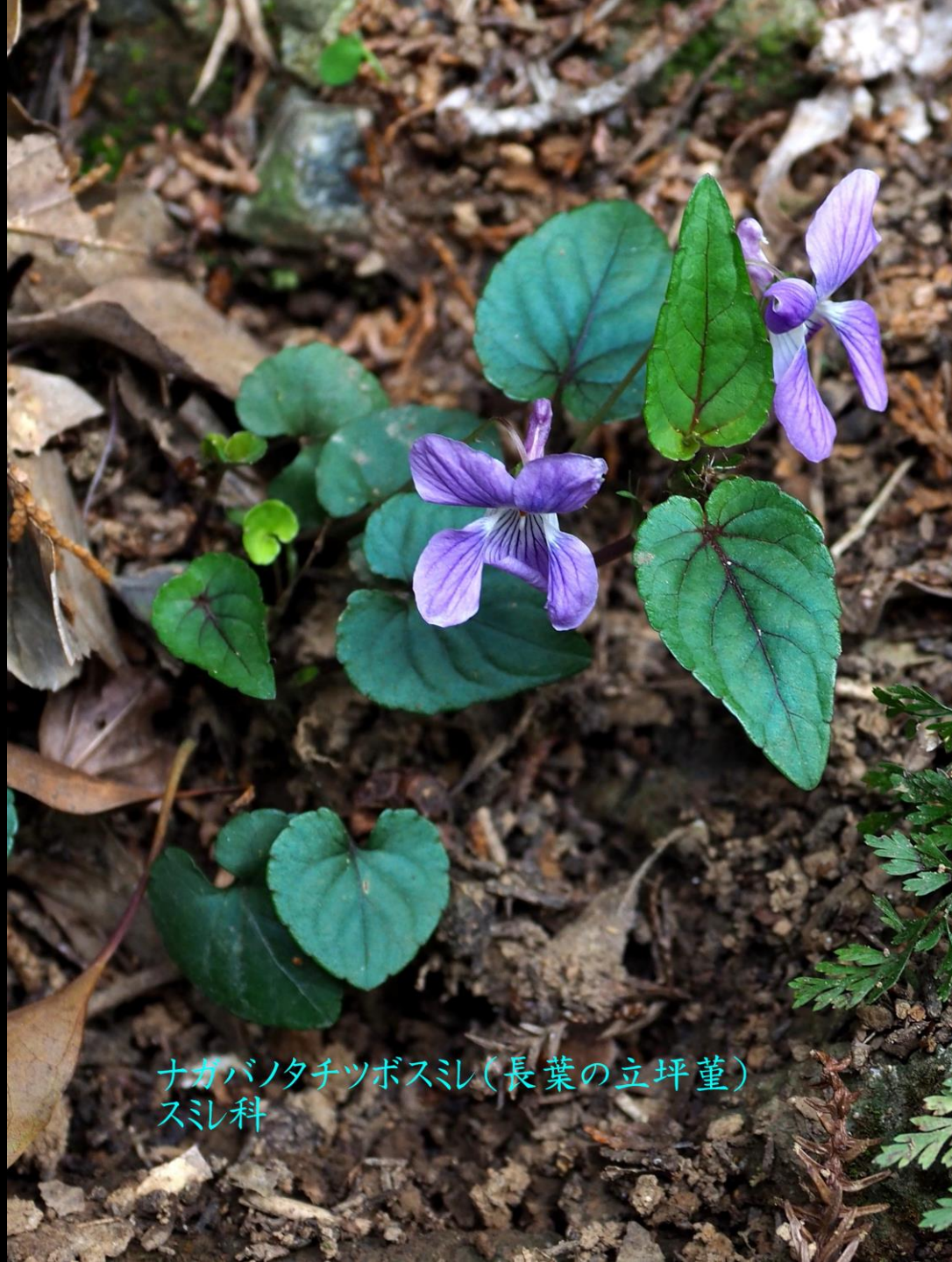
ナガバナタチツボスミレ(長葉の立坪堇) スミレ科