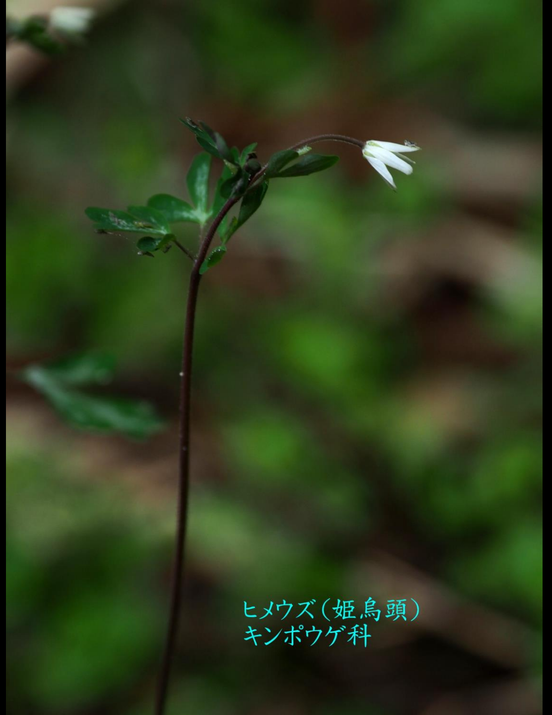
ヒメウズ(姫烏頭) キンポウゲ科