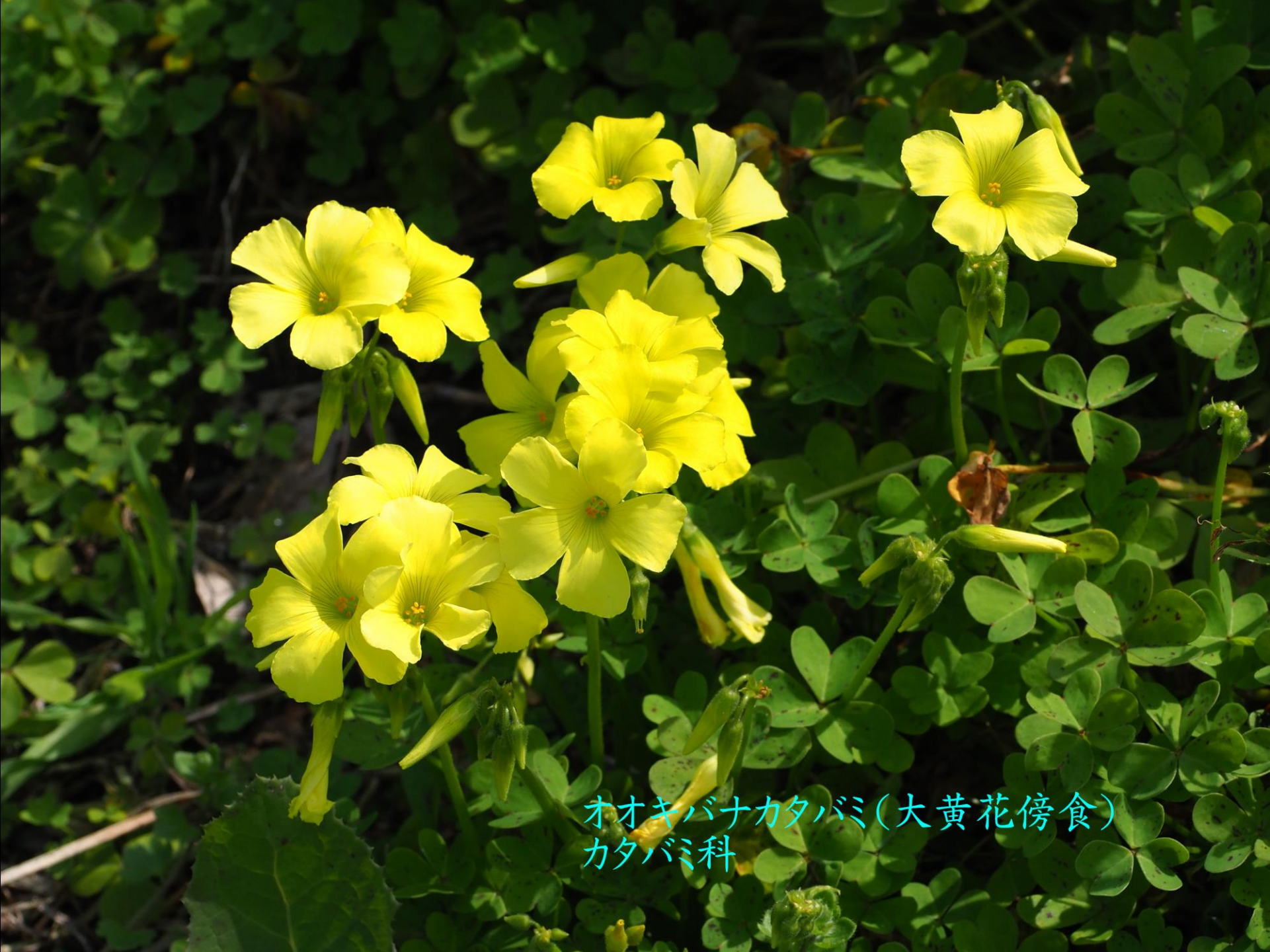
オオキバナカタバミ(大黄花傍食) カタバミ科