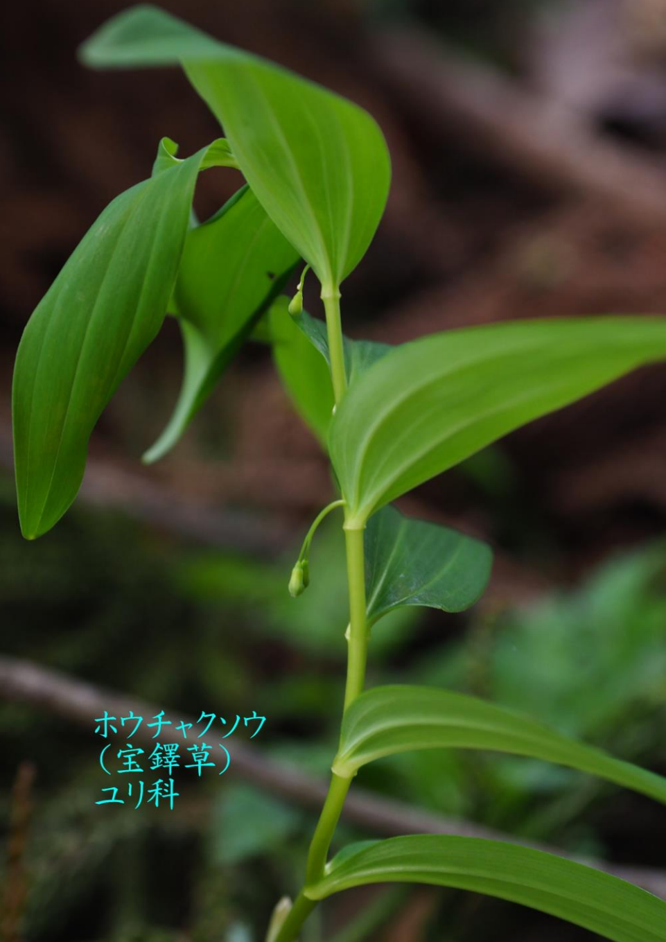
ホウチャクソウ (宝鐸草) ユリ科