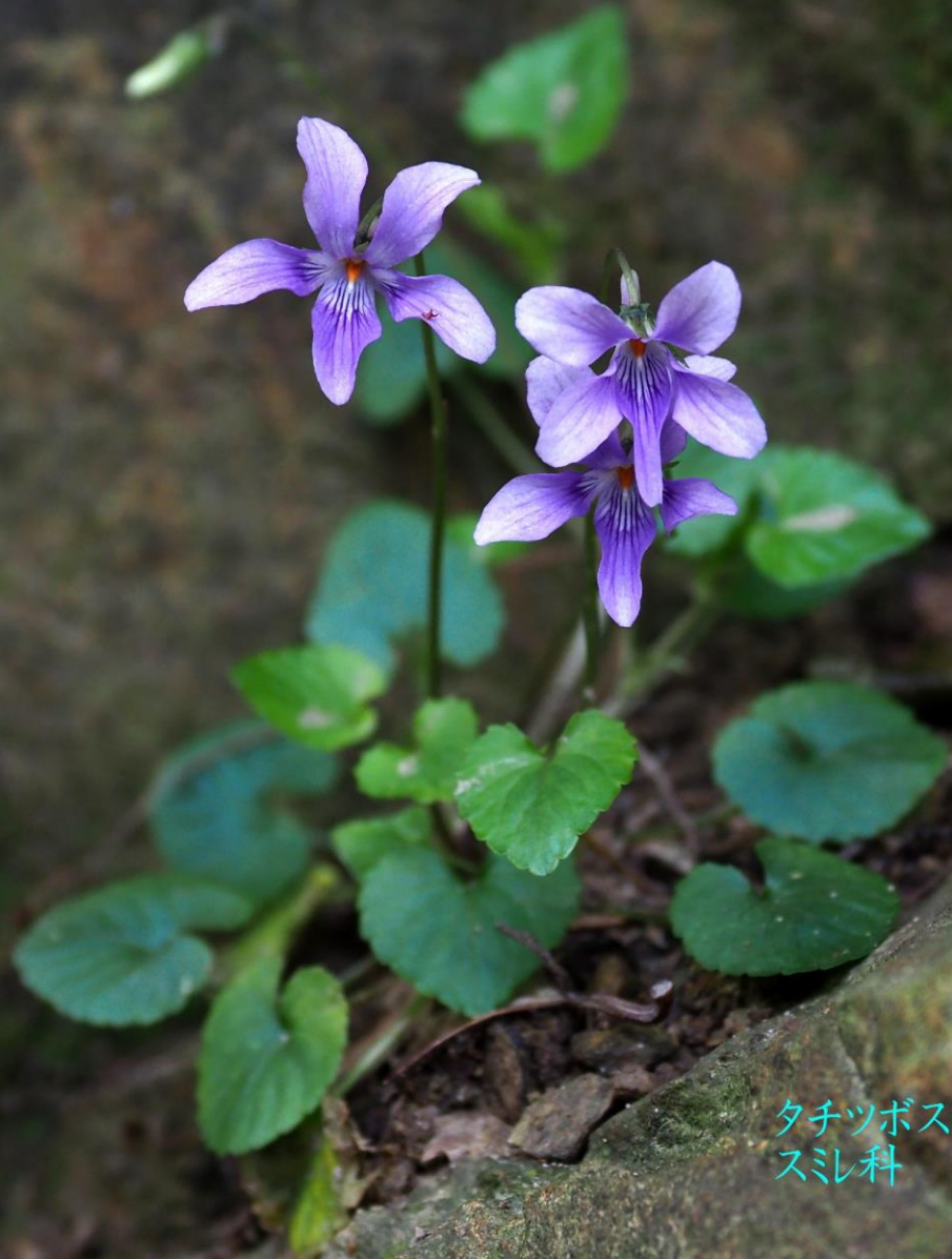
タチツボスミレ(立坪堇) スミレ科