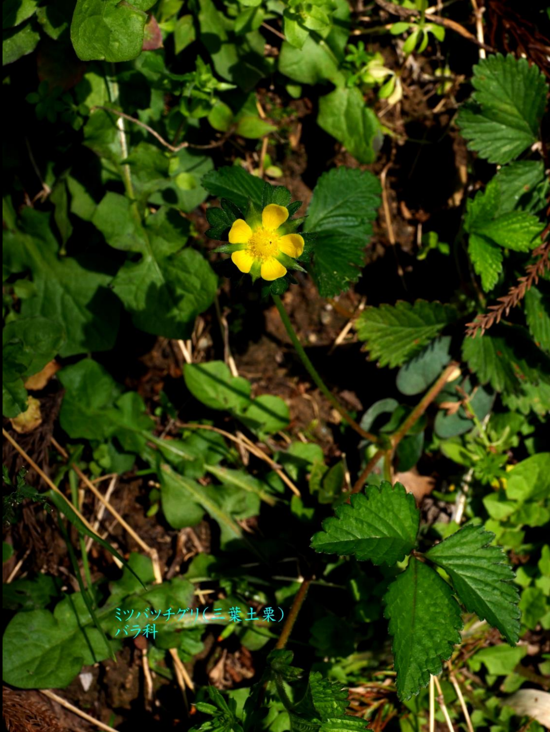
ミツバツチゲリ(三葉土栗) バラ科