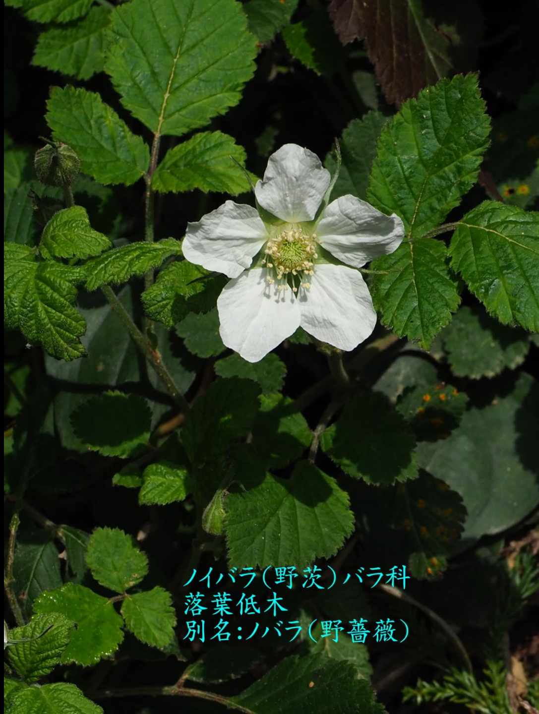
ノイバラ(野茨)バラ科 落葉低木 別名:ノバラ(野薔薇)