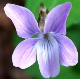
ナガバナタチツボスミ(長葉の立坪堇) スミレ科