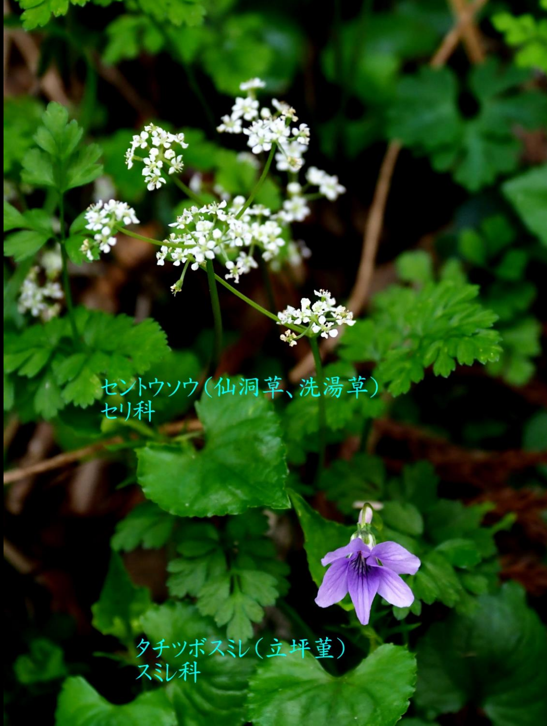
セントウソウ(仙洞草、洗湯草) セリ科