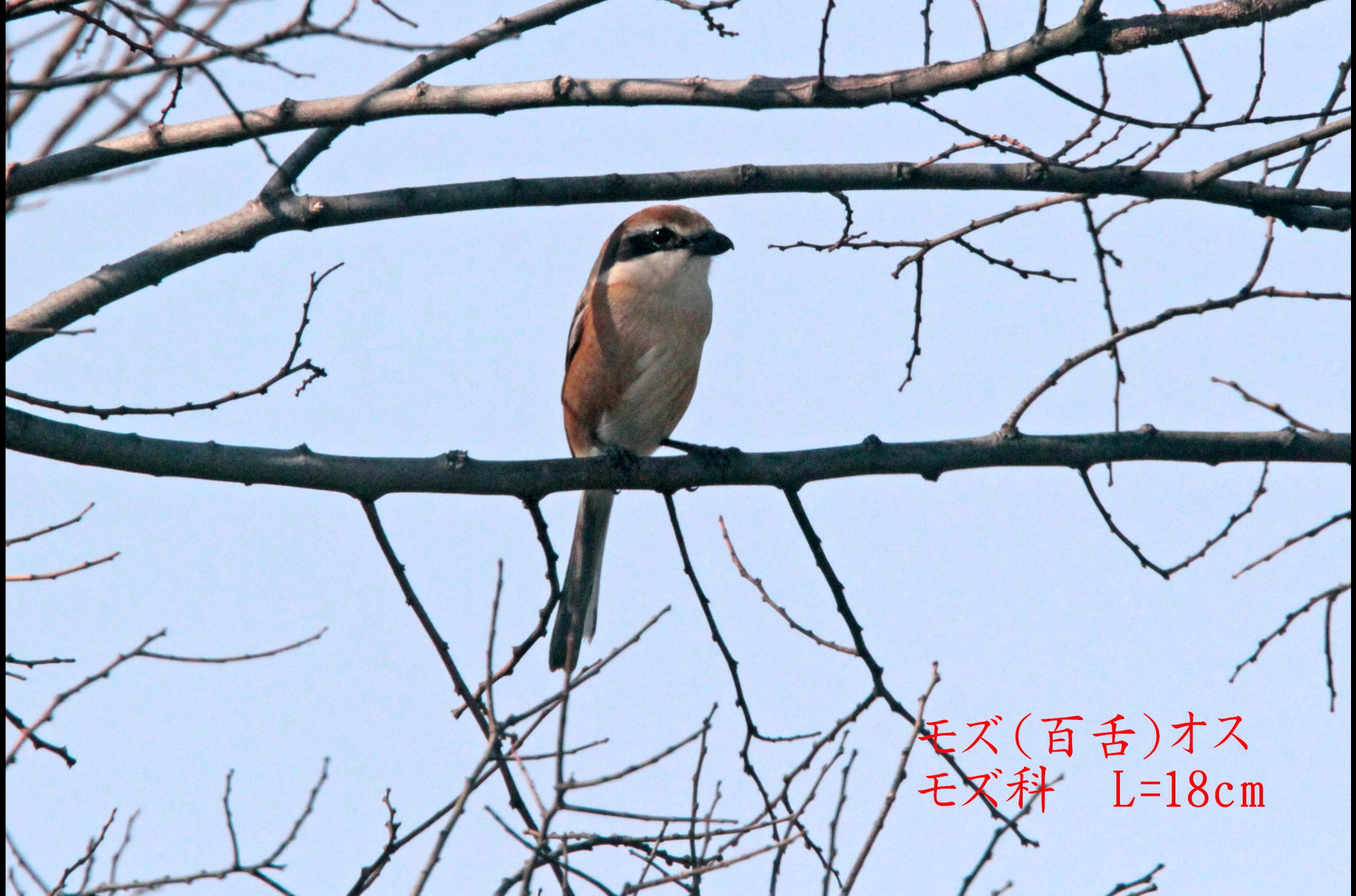
モズ(百舌)オス モズ科 L=18cm