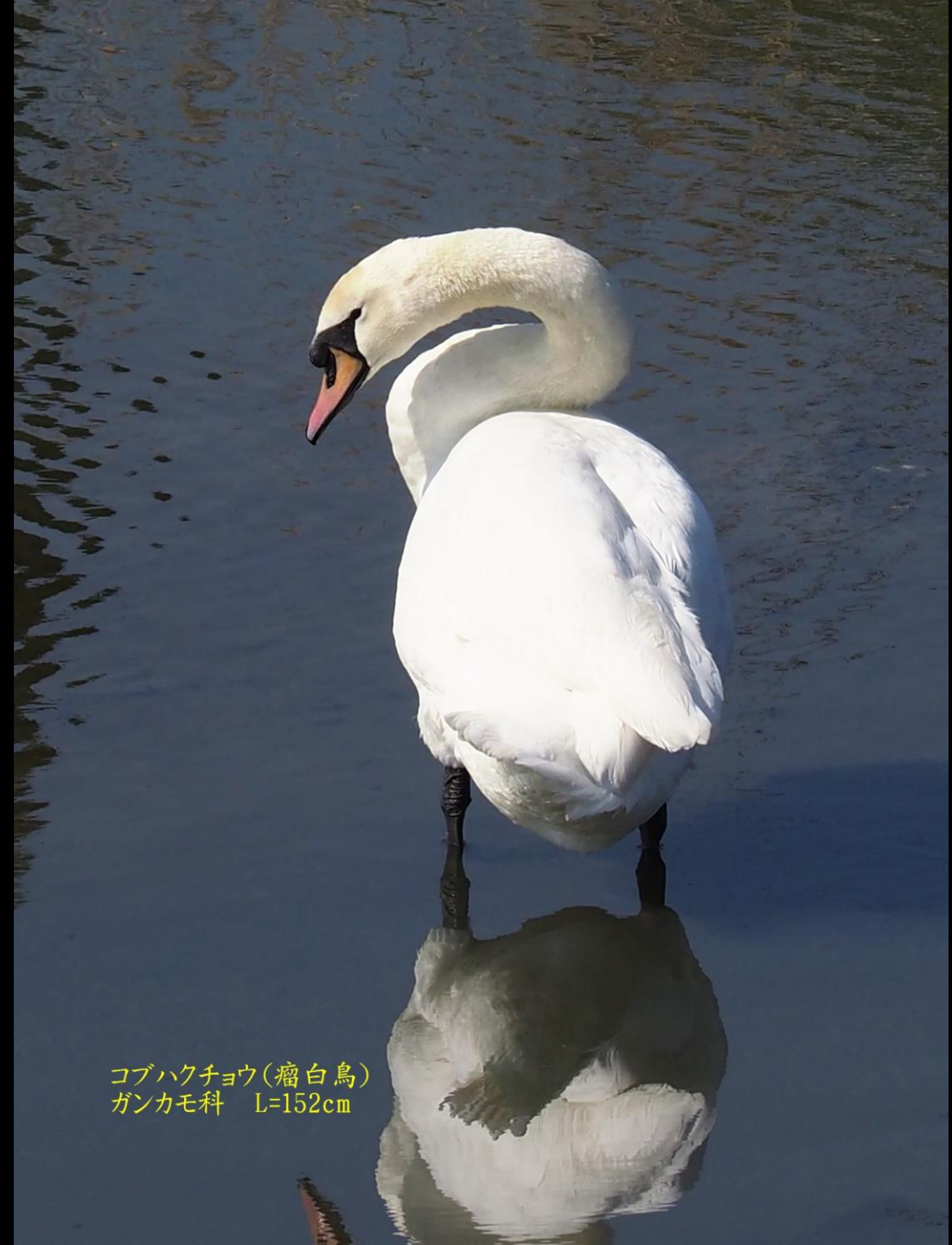
コブハクチョウ(瘤白鳥) ガンカモ科 L=152cm