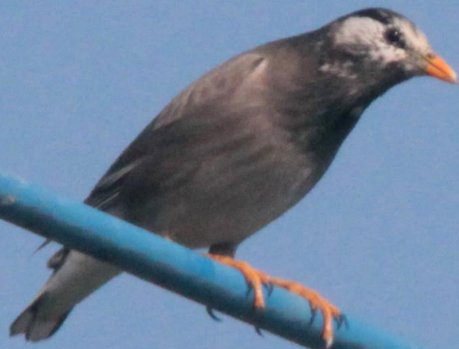
ムクドリ(椋鳥) ムクドリ科 L=24cm