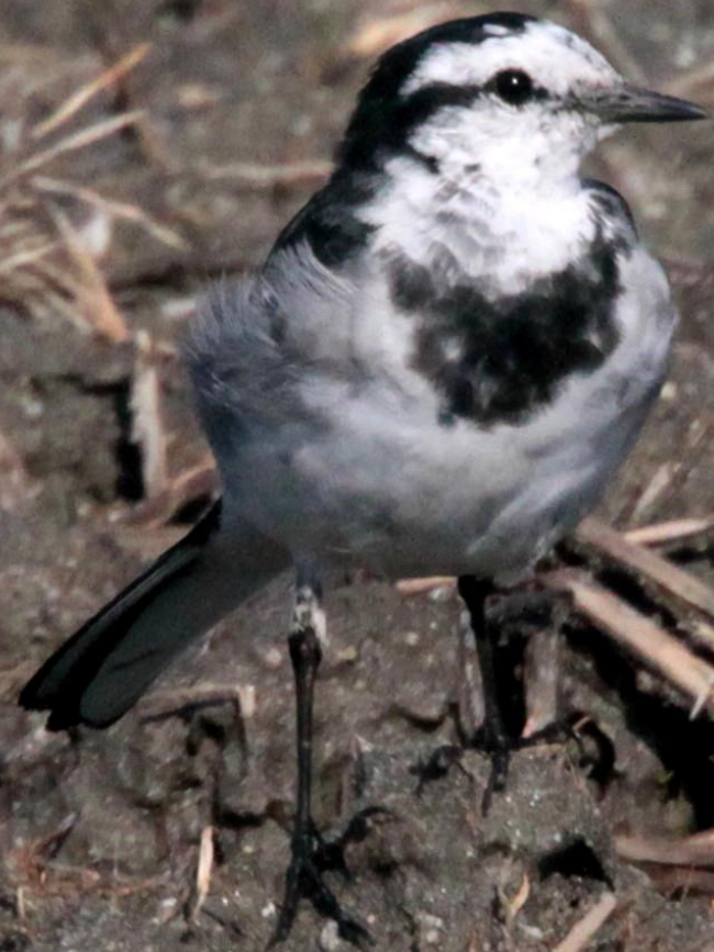
ハクセキレイ(白鶺鴒) セキレイ科 L=21cm