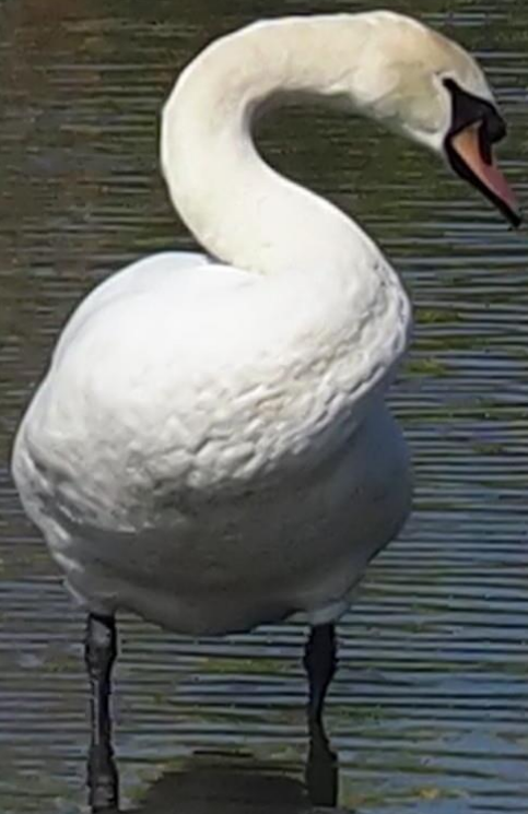
コブハクチョウ(瘤白鳥) ガンカモ科 L=152cm