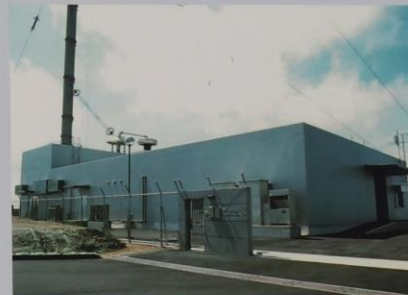
はがね山標準電波送信所 局舎 (原子時計室 / 送信機室 / 運用室等)