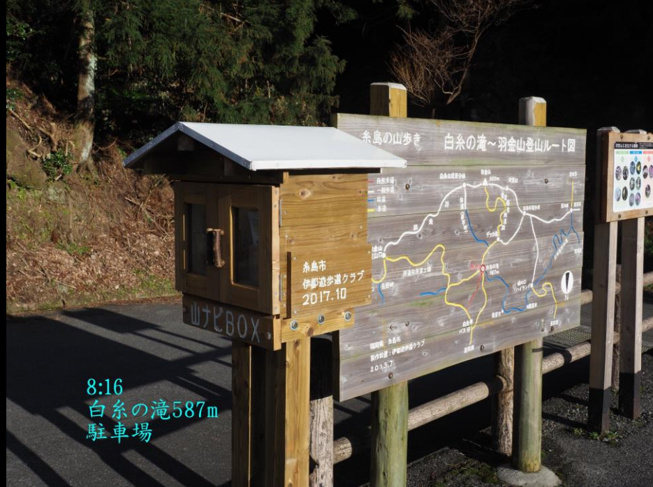
8:16 白糸の滝587m 駐車場