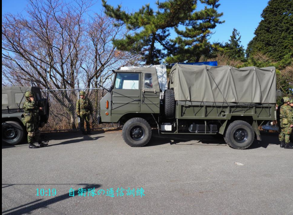
10:19 自衛隊の通信訓練