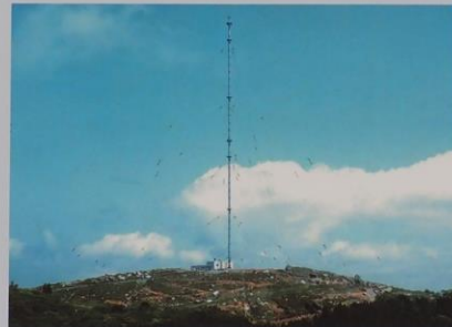
はがね山標準電波送信所 (地上高 200m アンテナ)