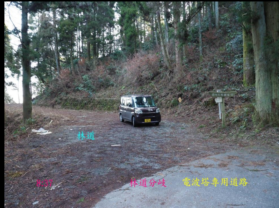
8:37 林道分岐 電波塔専用道路