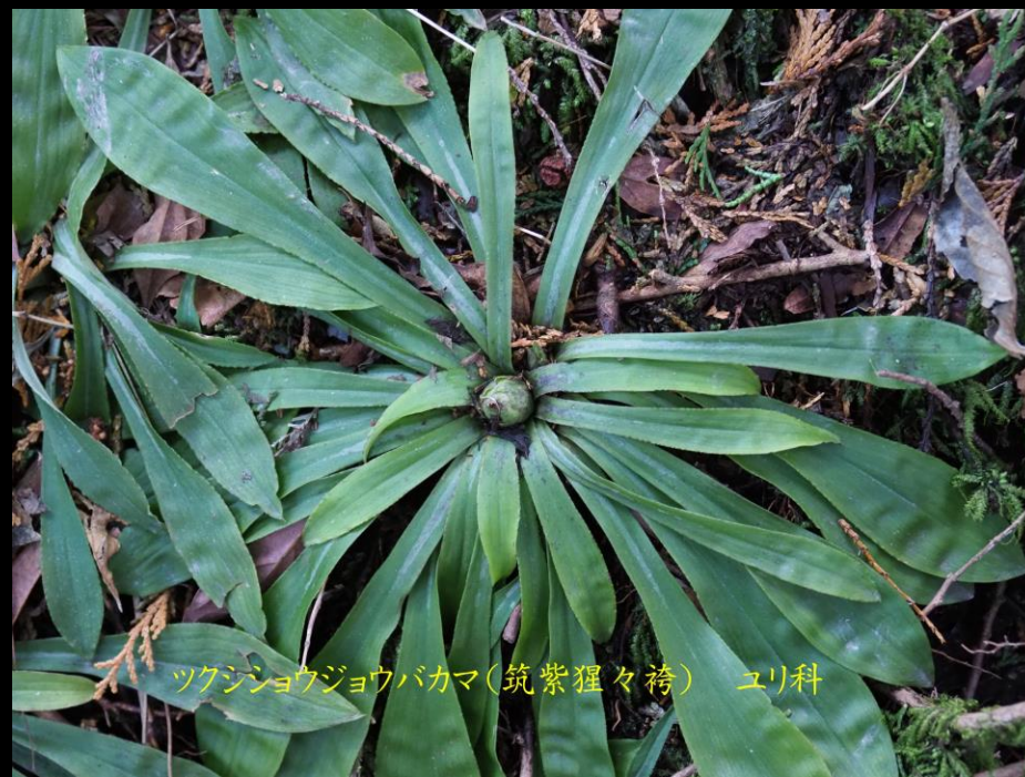
ツクシヨウジョウバカマ(筑紫狸々袴) ユリ科