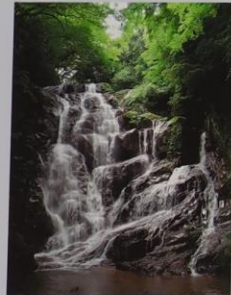
名勝 白糸の滝 (糸島市 長糸 ふれあいの里)

糸島市の西南山麓に位置する長糸校区は、豊かな山林と清流長野川、そして名勝「白糸の滝」に代表される自然と歴史に満ちた地域です。当地「白糸の滝」の先 羽金山 山頂に、地上高 200m のアンテナと「はがね山標準電波送信所」が建設されました。送信所から発信される電波は、「日本標準時」を全国に送り届ける重要な役割を担っています。人々の心を和ませてくれる美しい自然に恵まれた羽金山から「誤差ゼロ電波時計」の基となる基準信号が絶え間なく発射されています。