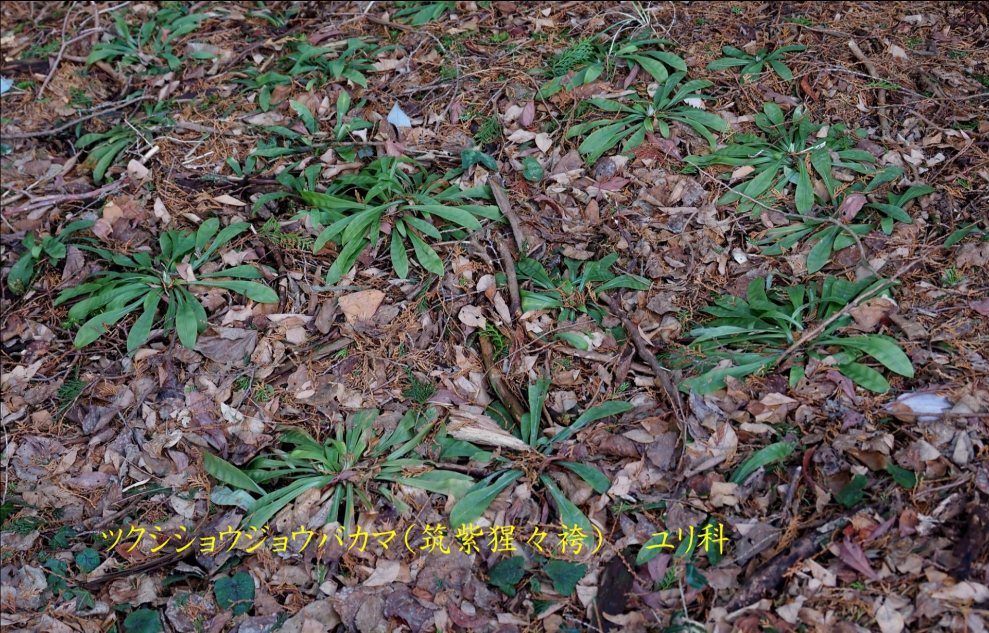
ツクシシヨウジョウバカマ(筑紫猩々袴) ユリ科