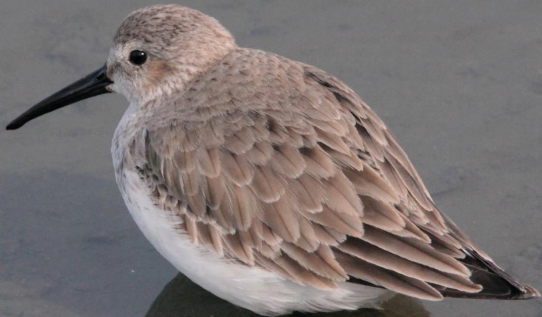
ハマシギ(滨鹬) シギ科 L=21cm