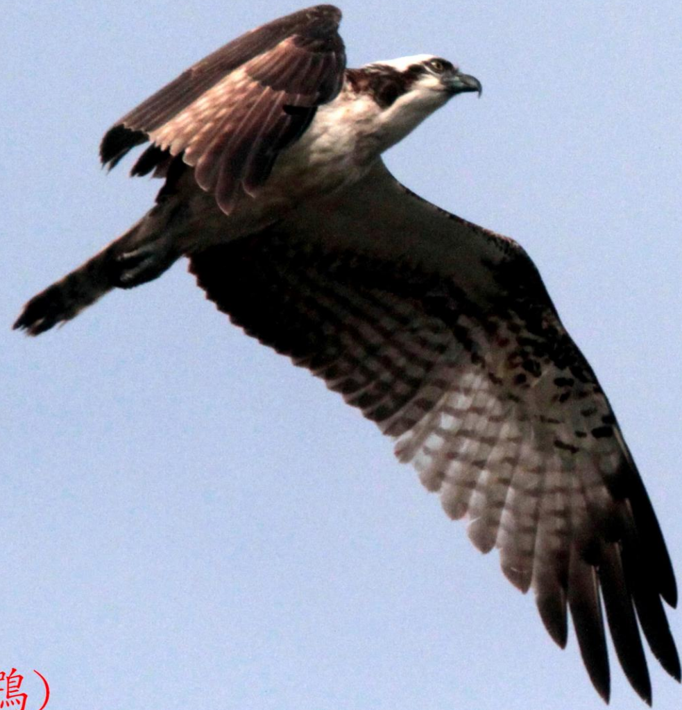
ミサゴ(鵟) ワシタカ科 L=オス54cm