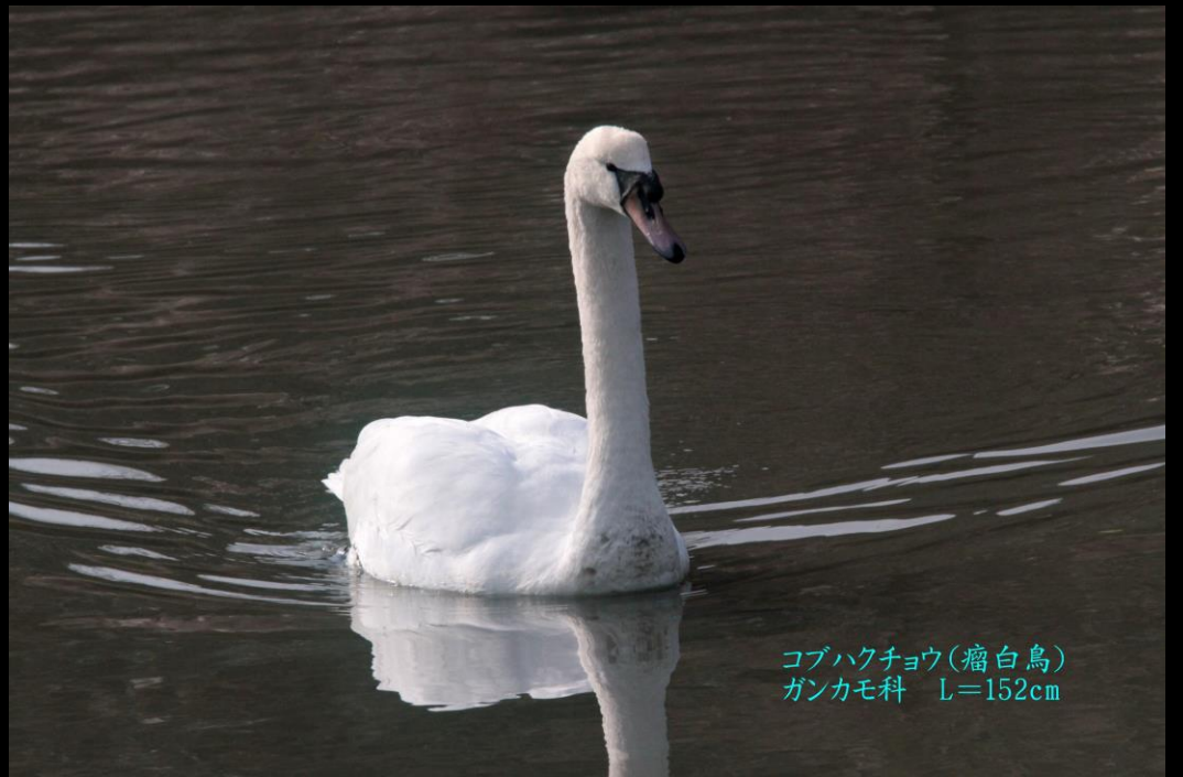
コブハクチョウ(瘤白鳥) ガンカモ科 L=152cm