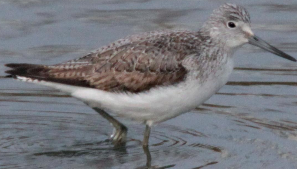
アオアシシギ(蒼脚鶺) シギ科 L=35cm