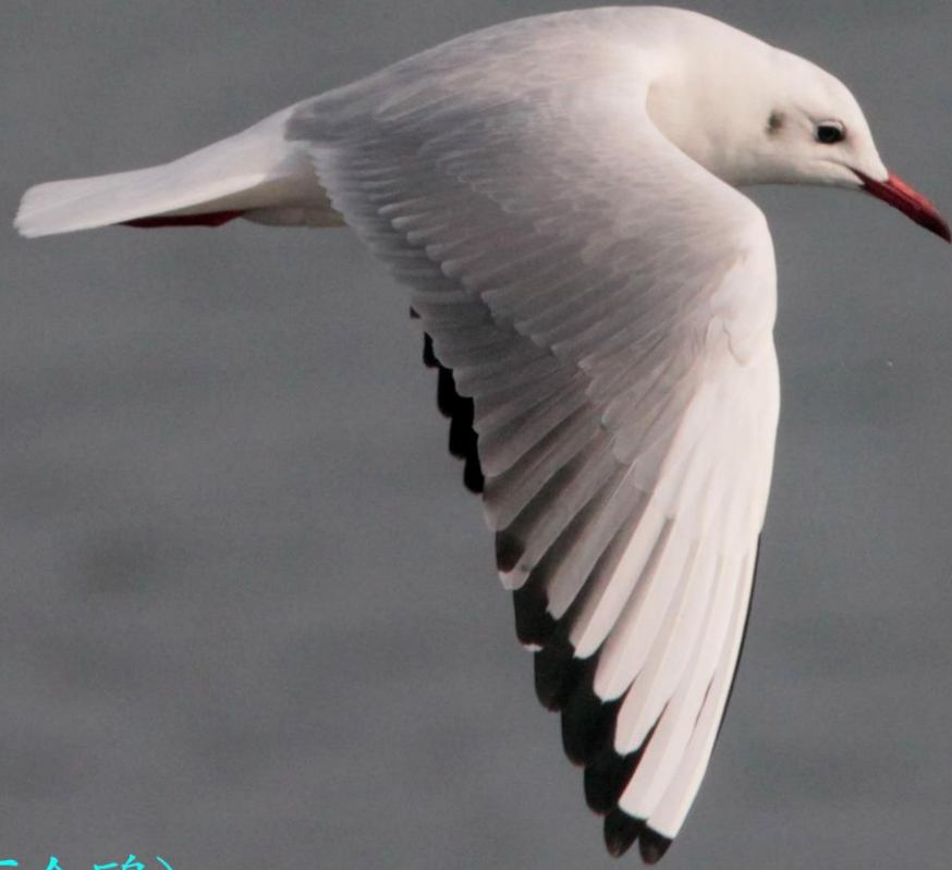
ユリカモメ(百合鷗) カモメ科 L=40cm