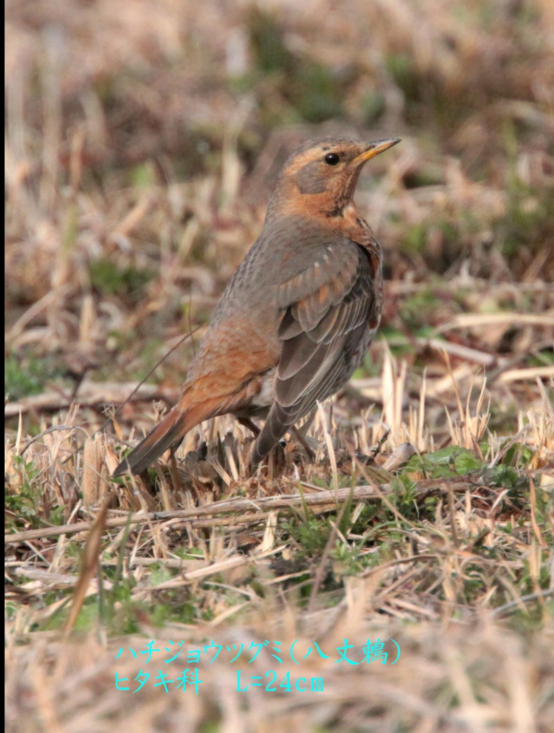
ハチジョウツゲミ(八丈鶉) ヒタキ科 L=24cm