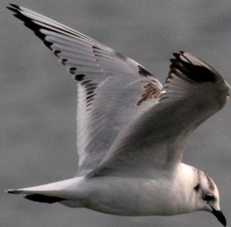
ズグロカモメ(頭黒鷗) カモメ科 L=32cm