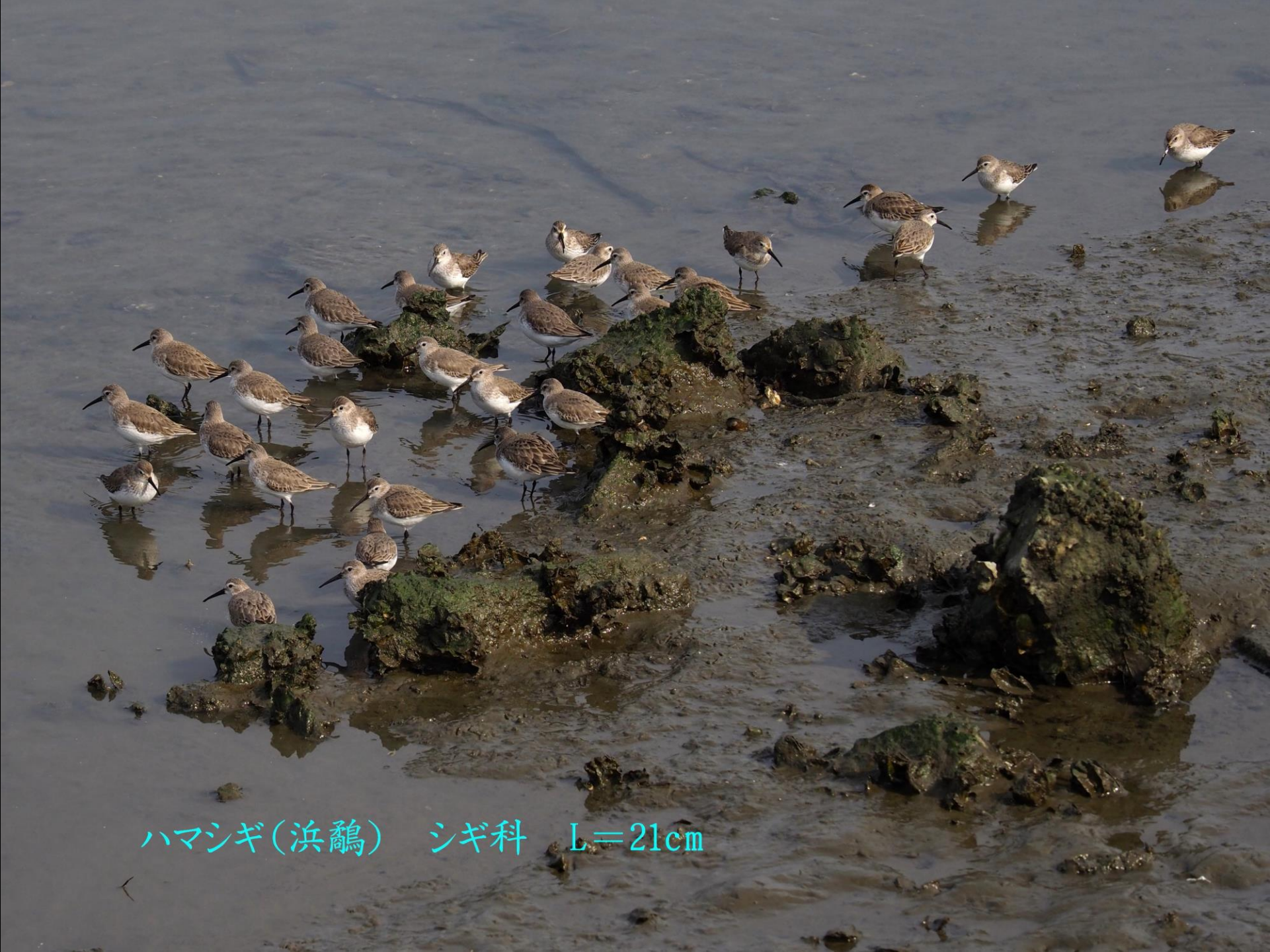
ハマシギ(滨鹬) シギ科 L=21cm