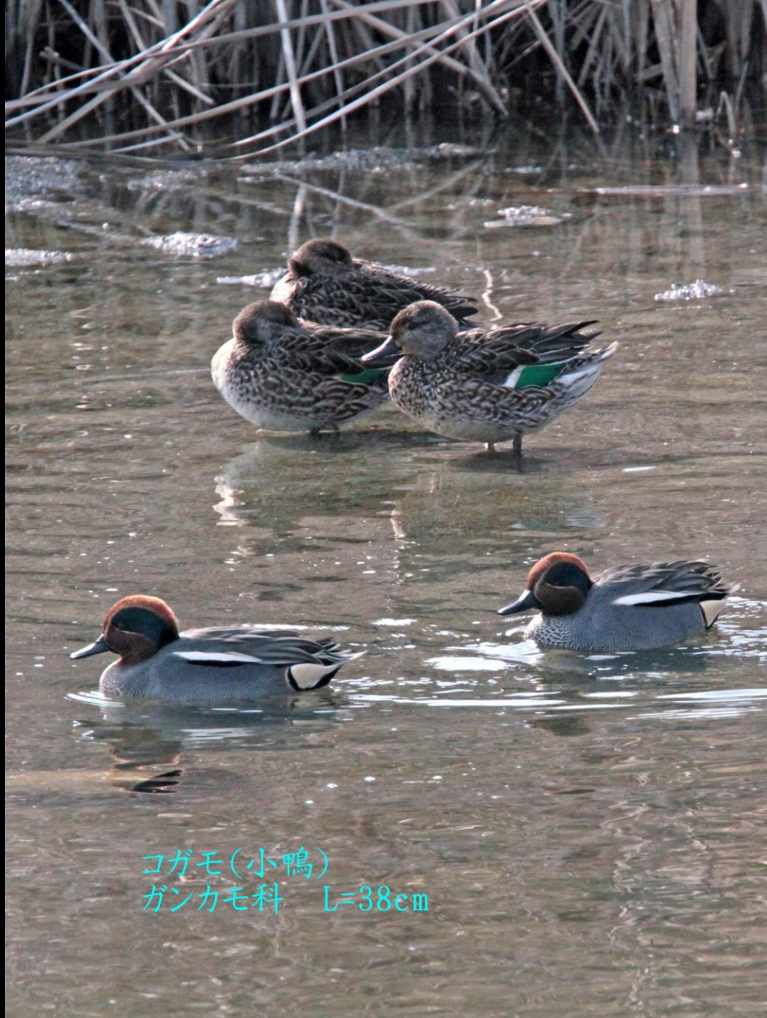
コガモ(小鴨) ガンカモ科 L=38cm