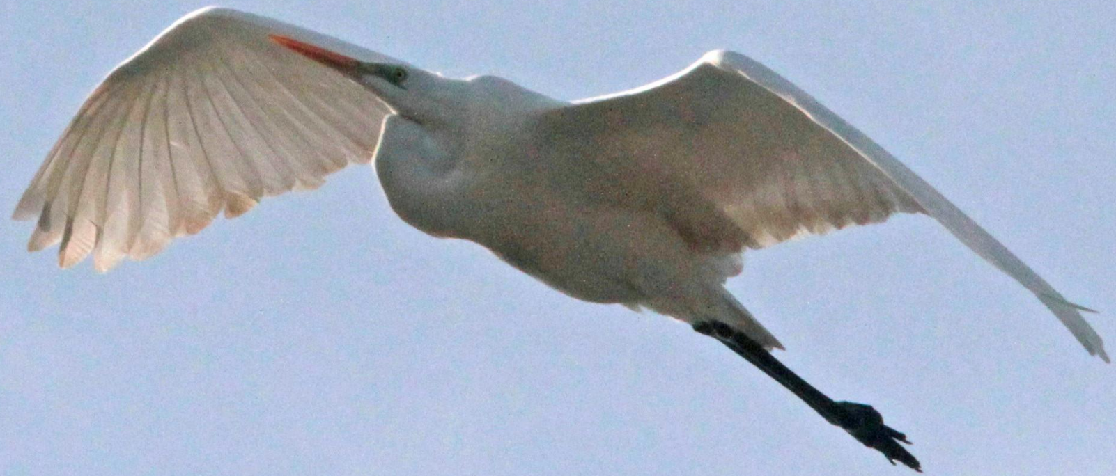
ダイサギ(大鷺) サギ科 L=90cm