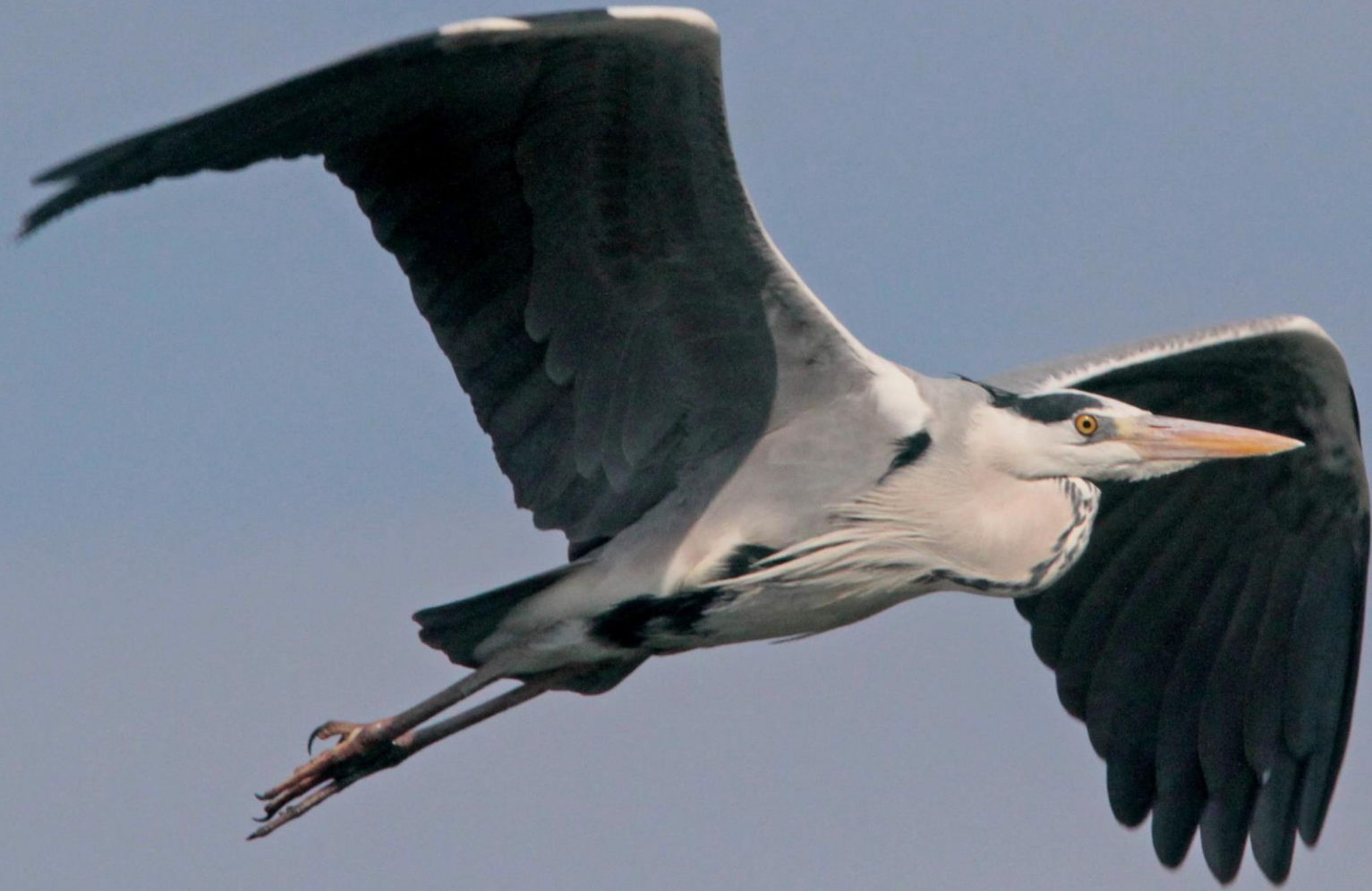
アオサギ(蒼鷺) サギ科 L=93cm