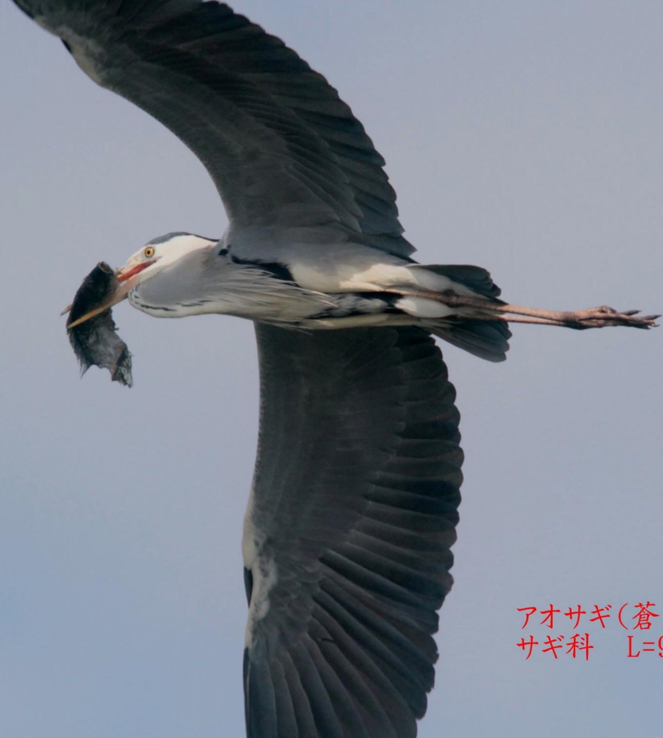
アオサギ(蒼鷺) サギ科 L=93cm