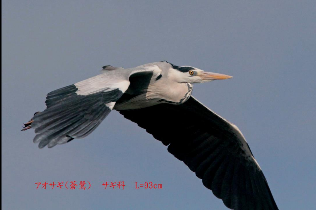
アオサギ(蒼鷺) サギ科 L=93cm