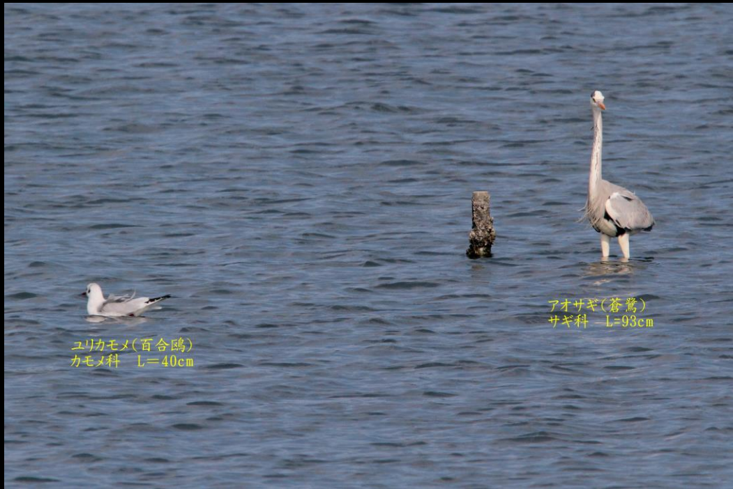
ユリカモメ(百合鷗) カモメ科 L=40cm