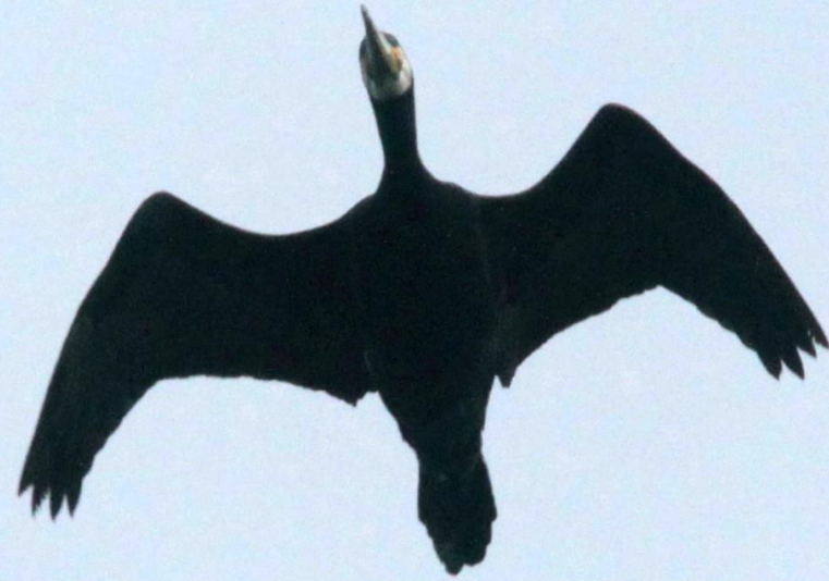
カワウ(河鵜) ウ科 L=82cm