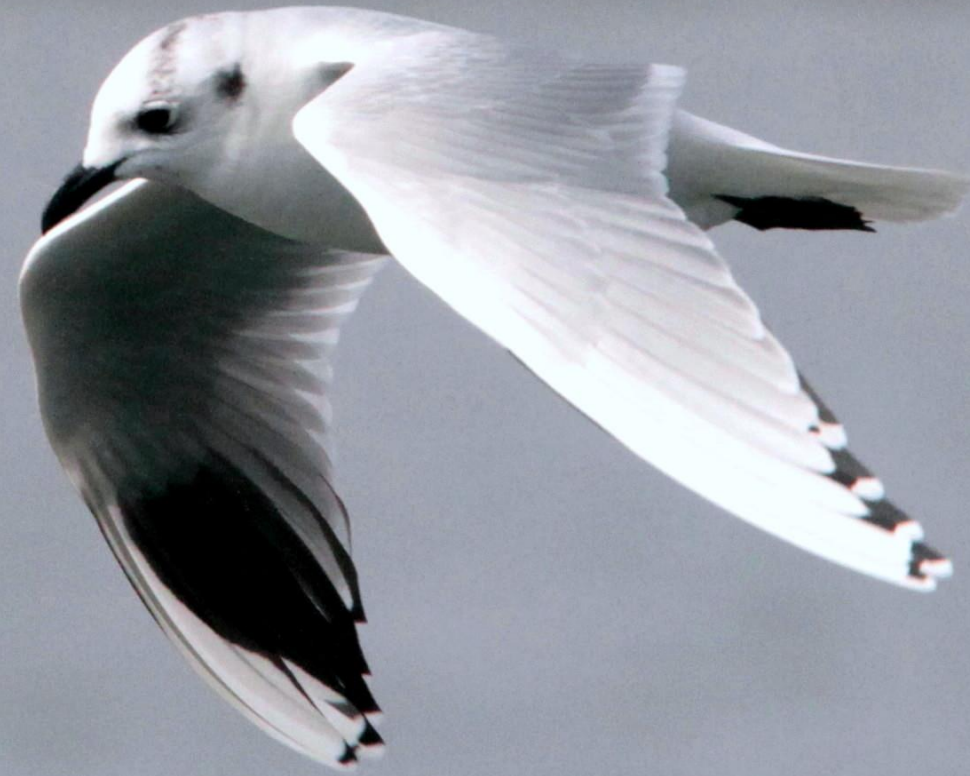
ズグロカモメ(頭黒鷗) カモメ科 L=32cm