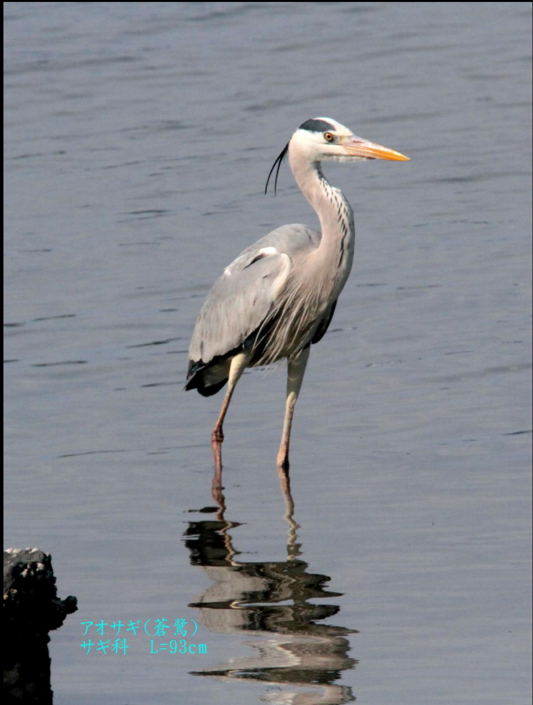
アオサギ(蒼鷺) サギ科 L=93cm