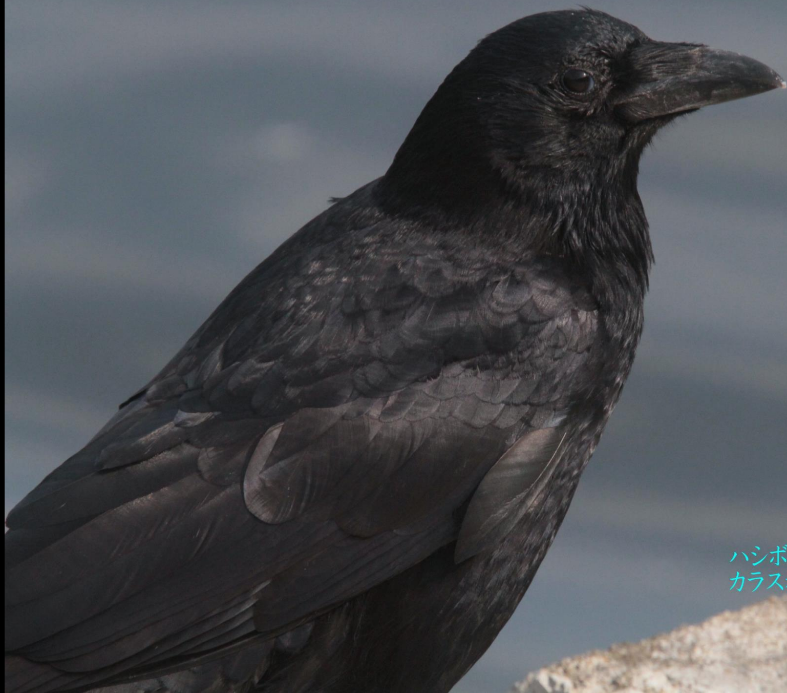
ハシボソガラス(嘴細鴉) カラス科 L=50cm