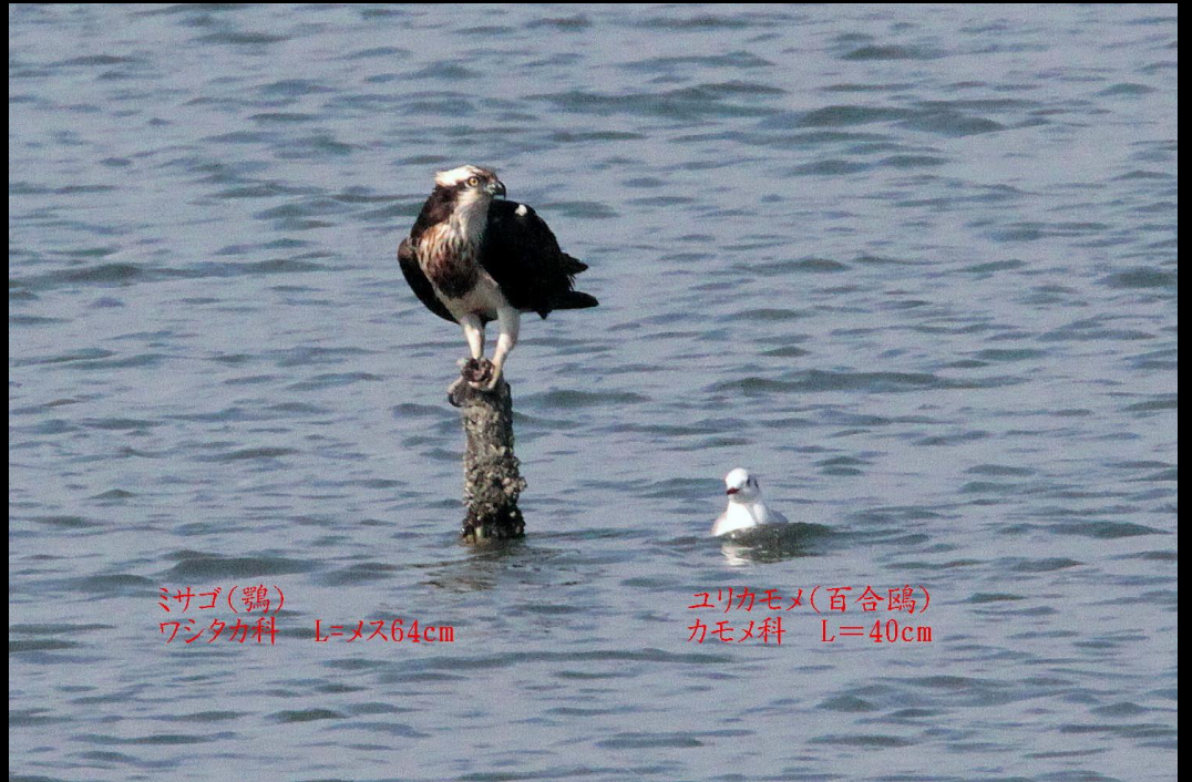
ミサゴ(鵜) ワシタカ科 L=メス64cm