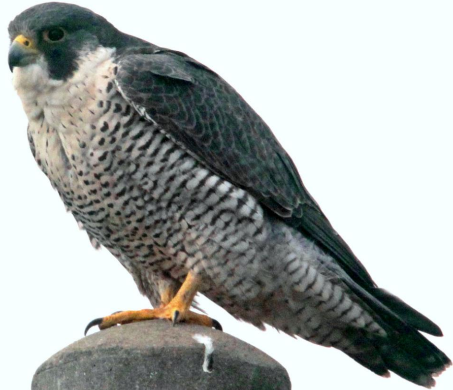
ハヤブサ(隼) ハヤブサ科 L=メス49cm