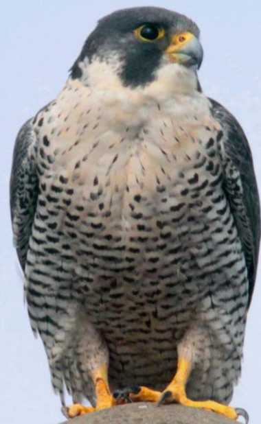
ハヤブサ(隼) ハヤブサ科 L=メス49cm