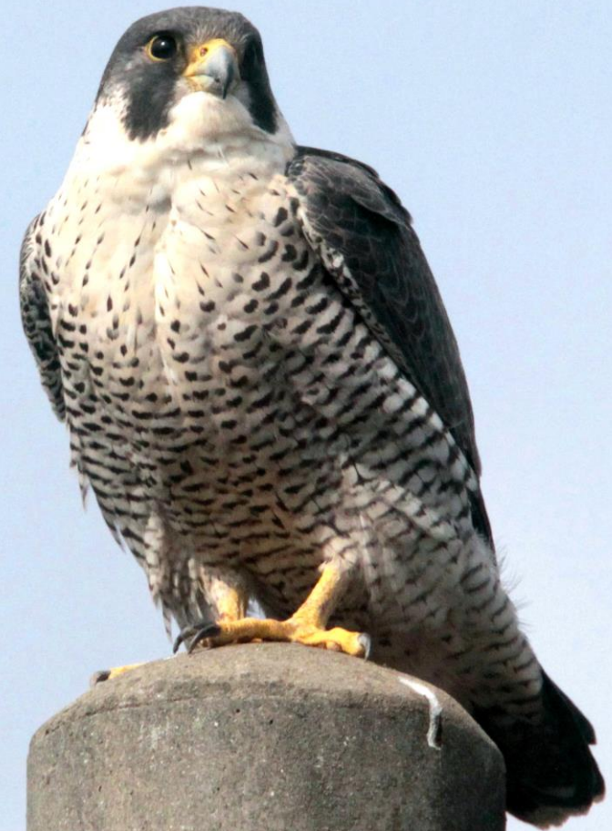
ハヤブサ(隼) ハヤブサ科 L=メス49cm