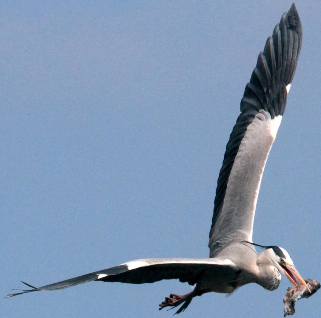
アオサギ(蒼鷺) サギ科 L=93cm