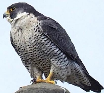
ハヤブサ(隼) ハヤブサ科 L=メス49cm