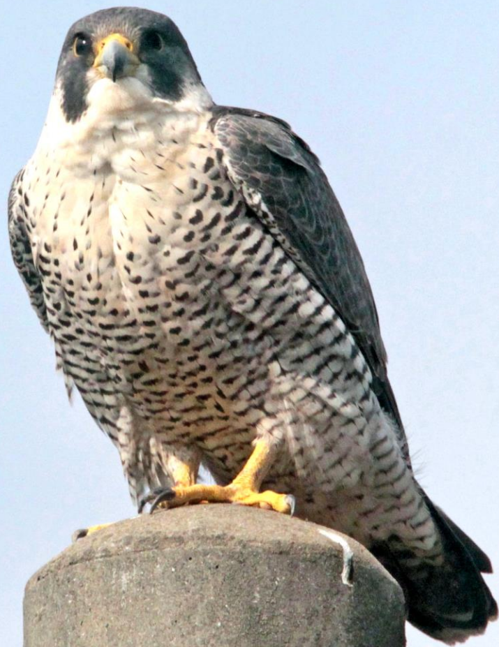
ハヤブサ(隼) ハヤブサ科 L=メス49cm