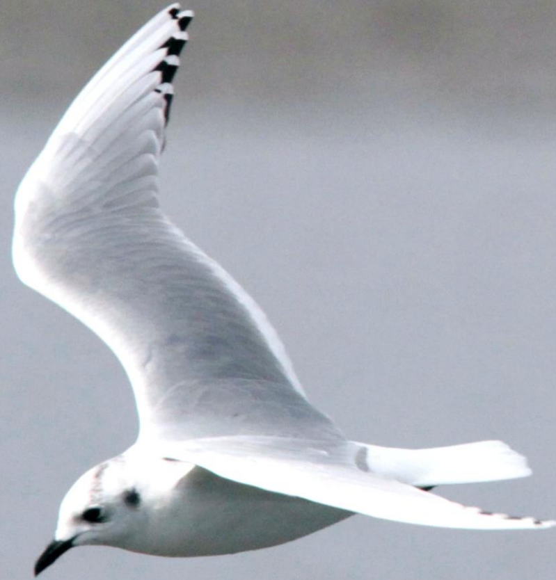
ズグロカモメ(頭黒鷗) カモメ科 L=32cm