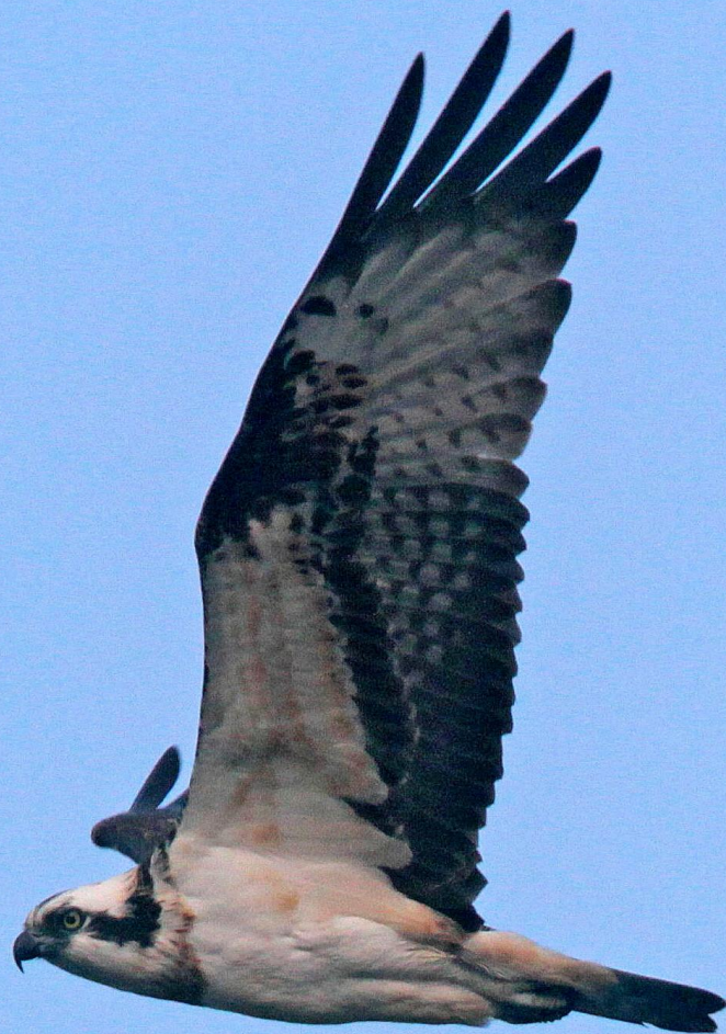
ミサゴ (鵟) ワシタカ科 L=メス64cm