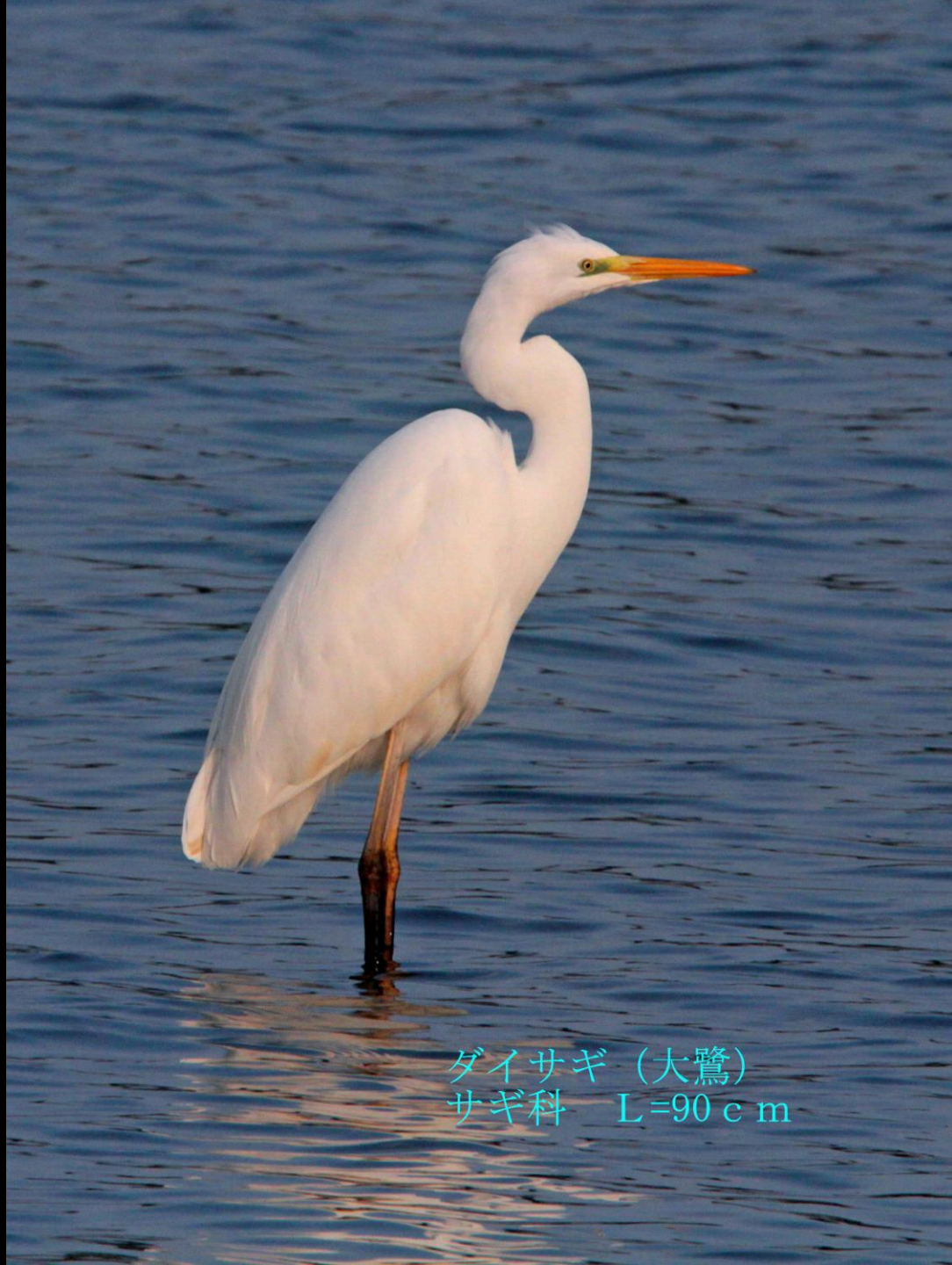
ダイサギ (大鷺) サギ科 L=90cm