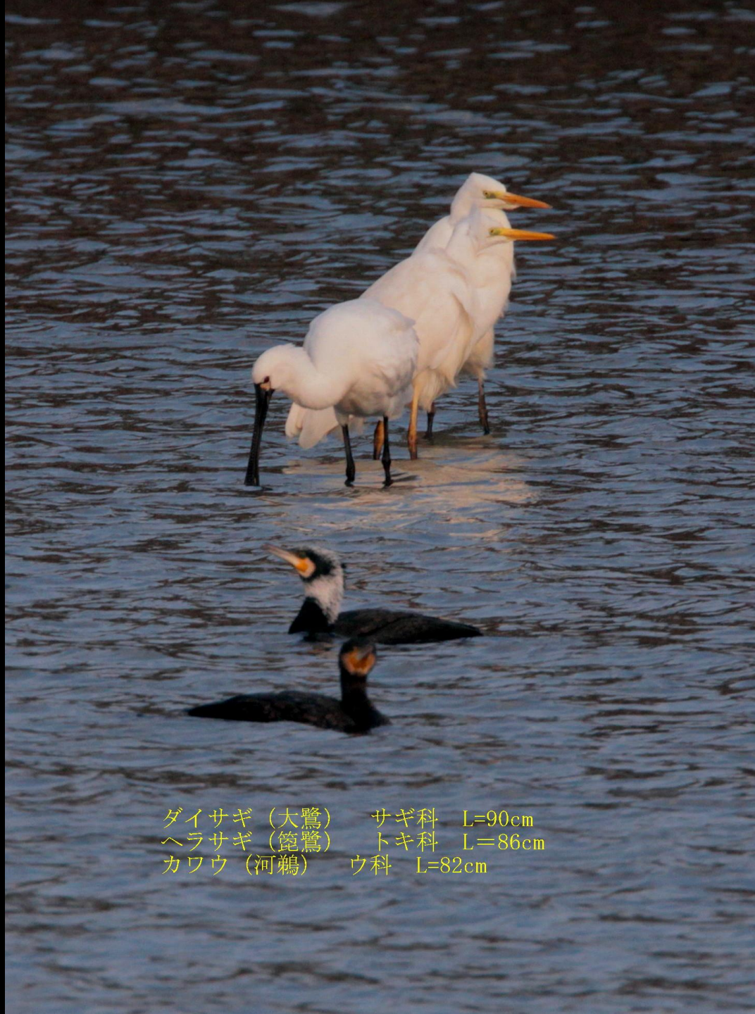
ダイサギ (大鷺) サギ科 L=90cm ヘラサギ (篋鷺) トキ科 L=86cm カワウ (河鵜) ウ科 L=82cm