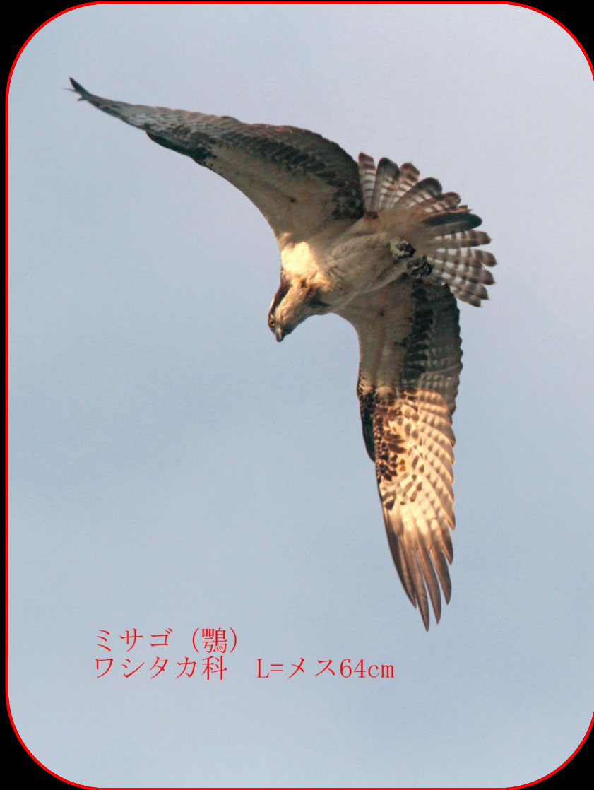
ミサゴ (鵟) ワシタカ科 L=メス64cm