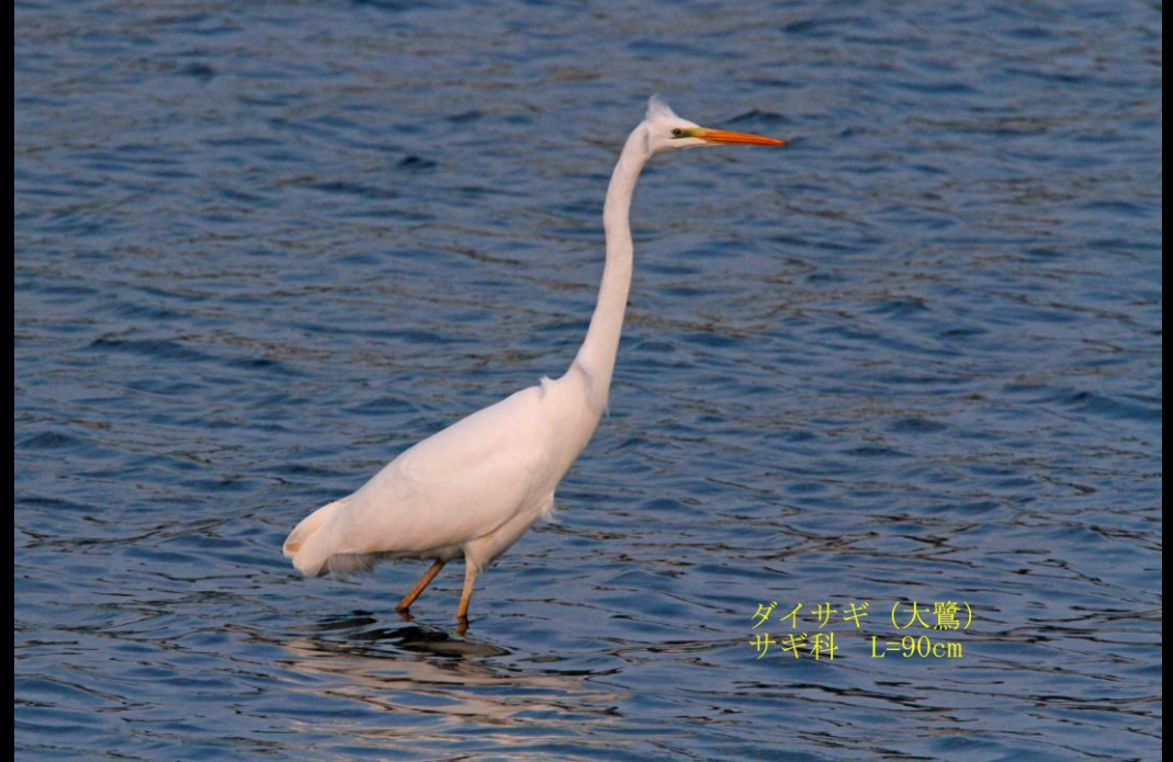
ダイサギ (大鷺) サギ科 L=90cm