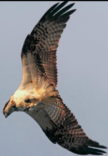
ミサゴ (鵟) ワシタカ科 L=メス64cm