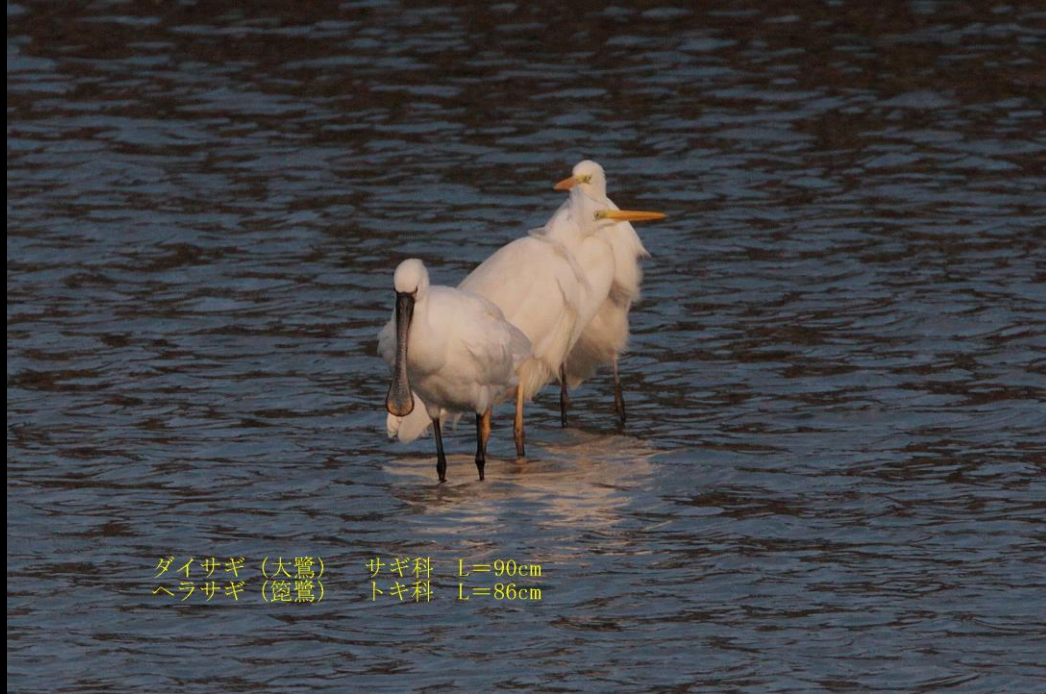
ダイサギ (大鷺) サギ科 L=90cm ヘラサギ (篋鷺) トキ科 L=86cm