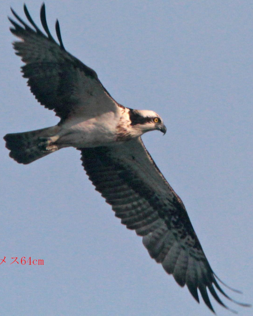
ミサゴ (鵟) ワシタカ科 L=メス64cm