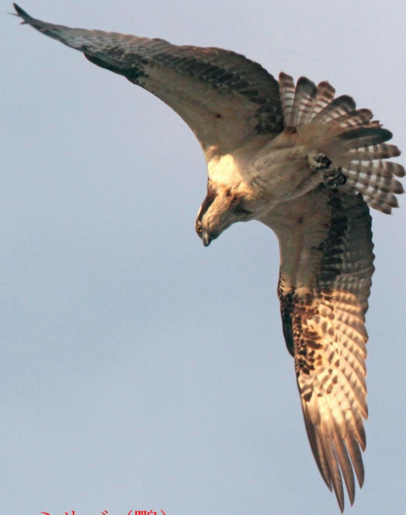
ミサゴ (鵟) ワシタカ科 L=メス64cm