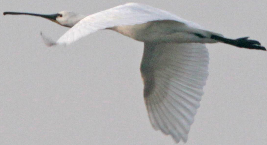
ヘラサギ (篋鷺) トキ科 L=86cm