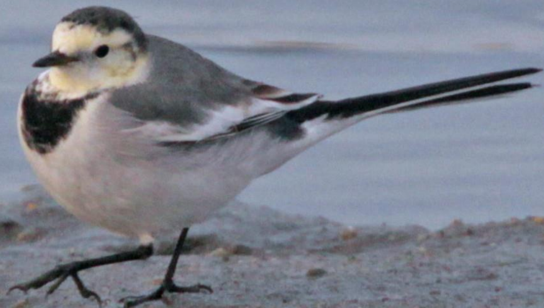
ハクセキレイ (白鶺鴒) セキレイ科 L=21cm