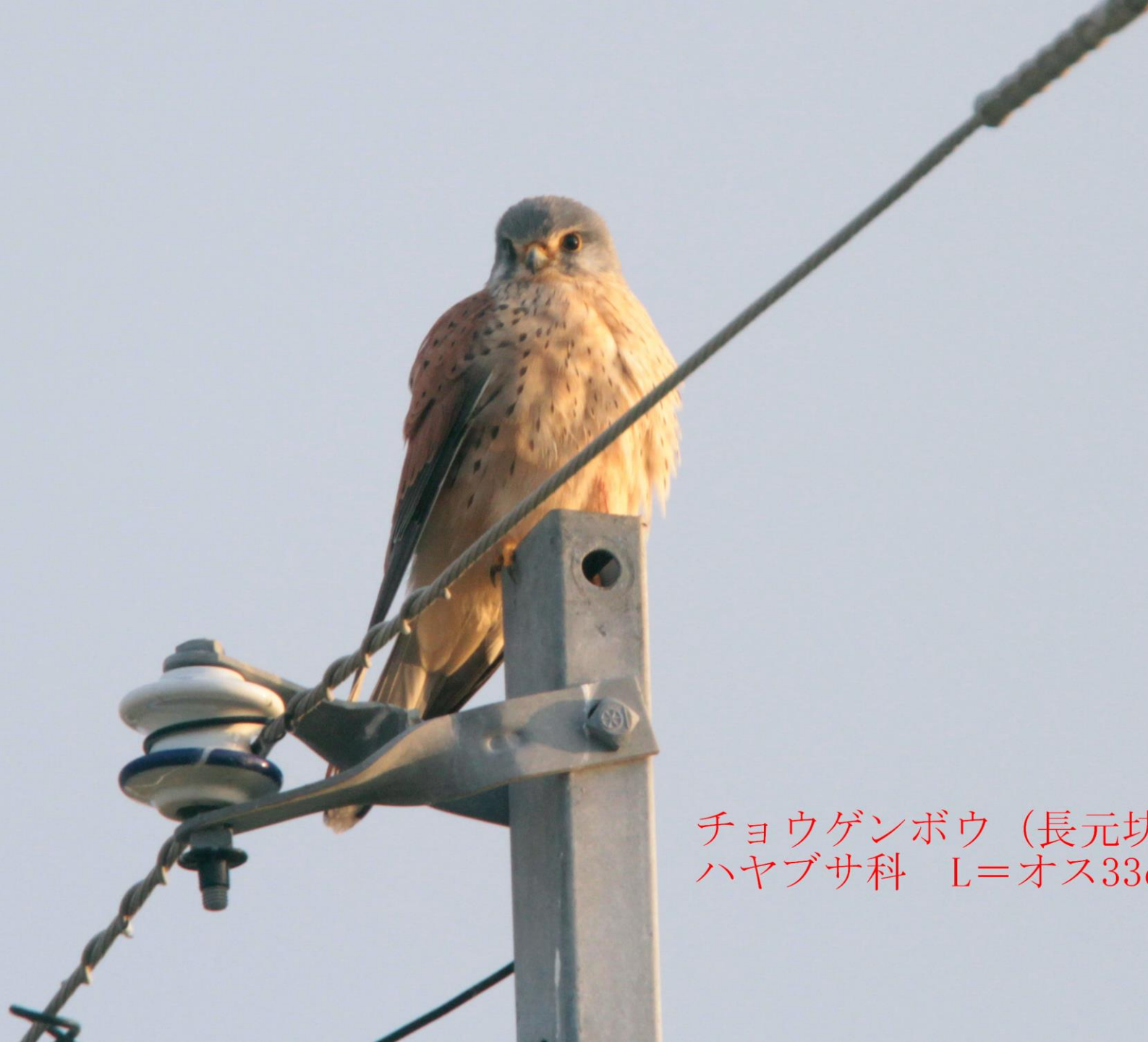
チョウゲンボウ (長元坊) ハヤブサ科 L=オス33cm