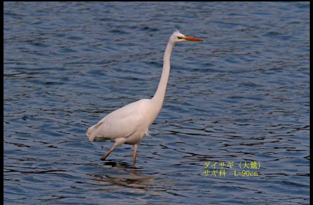
ダイサギ (大鷺) サギ科 L=90cm