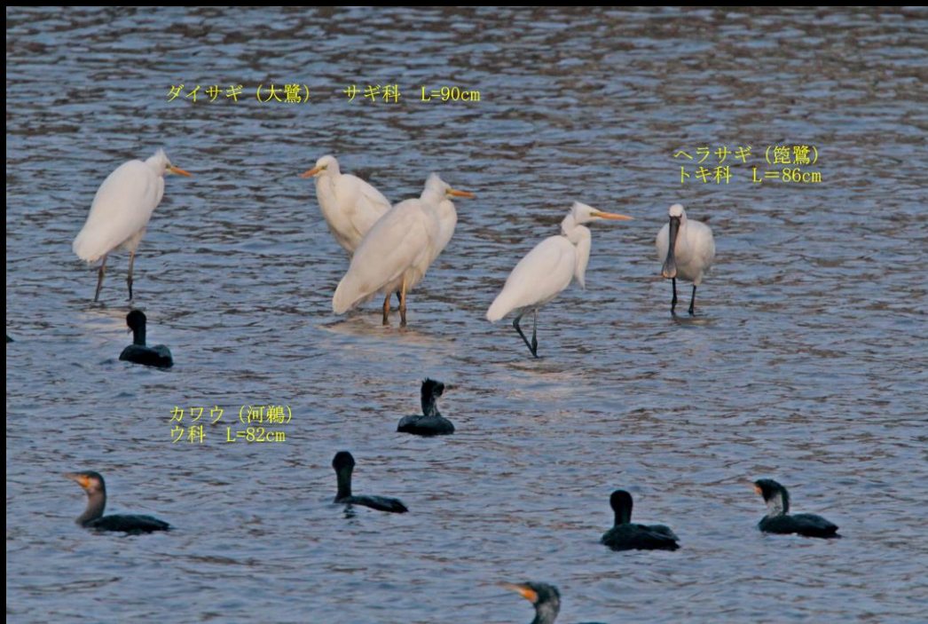
ダイサギ (大鷺) サギ科 L=90cm