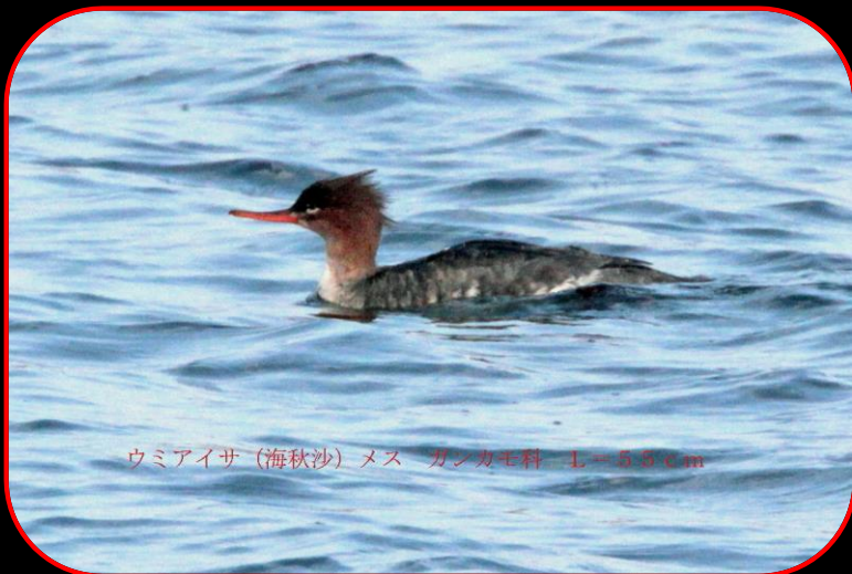
ウミアイサ (海秋沙) メス カシカモ科 L=55cm