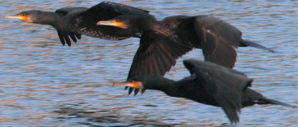
カワウ (河鵜) ウ科 L=82cm