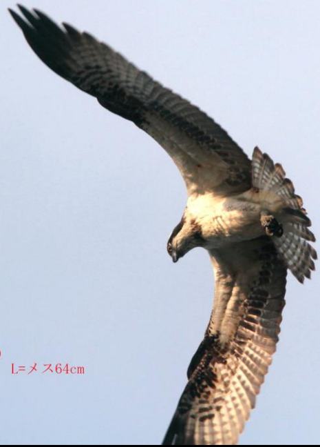
ミサゴ (鵟) ワシタカ科 L=メス64cm