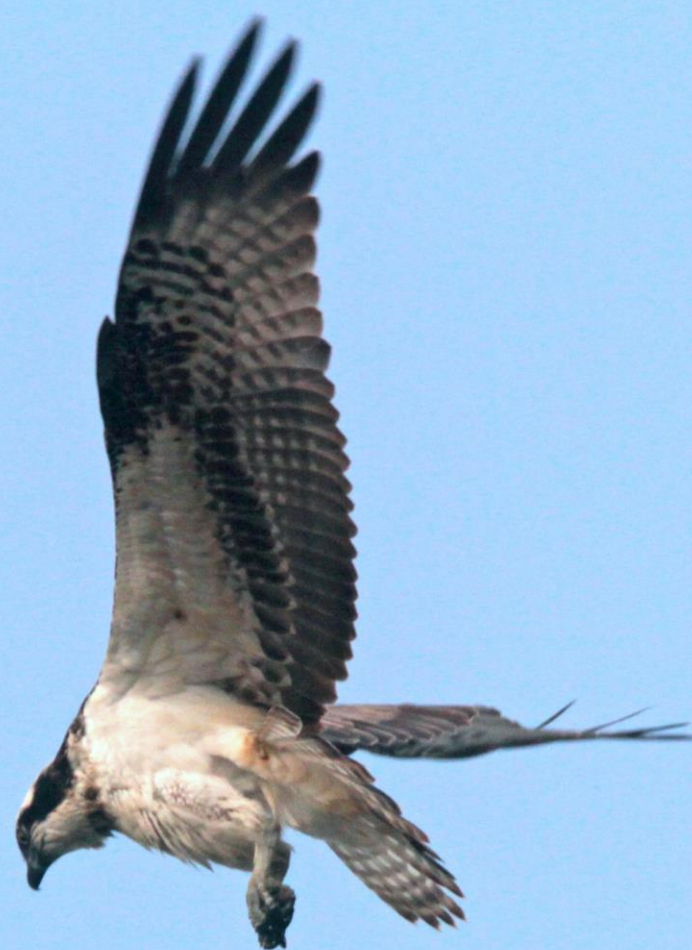
ミサゴ (鵟) ワシタカ科 L=メス64cm