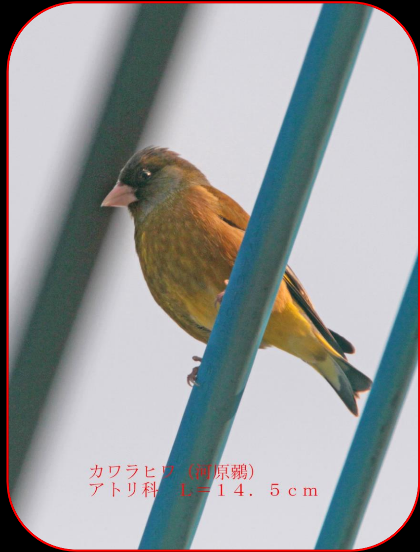
カワラヒワ (河原鵲) アトリ科 L=14.5cm