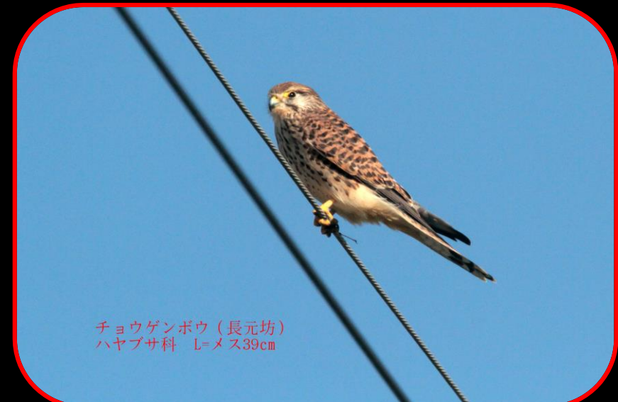
チョウゲンボウ（長元坊） ハヤブサ科 L=メス39cm