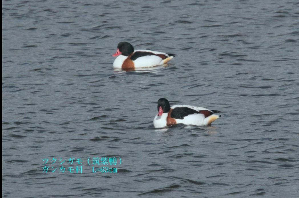
ツクシガモ (筑紫鴨) ガンカモ科 L=63cm