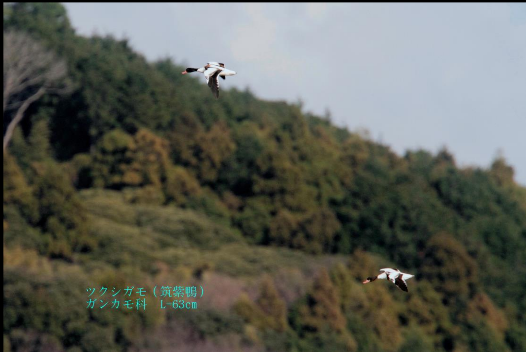
ツクシガモ (筑紫鴨) ガンカモ科 L=63cm