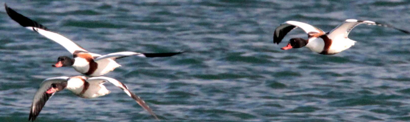
ツクシガモ（筑紫鴨） ガンカモ科 L=63cm