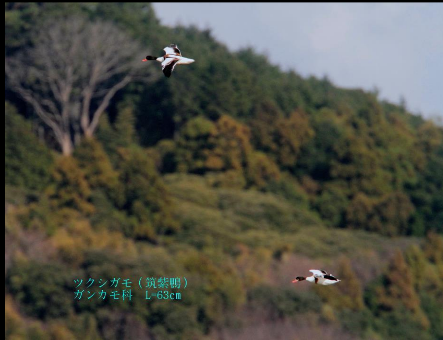
ツクシガモ (筑紫鴨) ガンカモ科 L=63cm