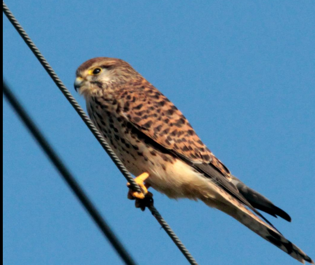
チョウゲンボウ（長元坊） ハヤブサ科 L=メス39cm