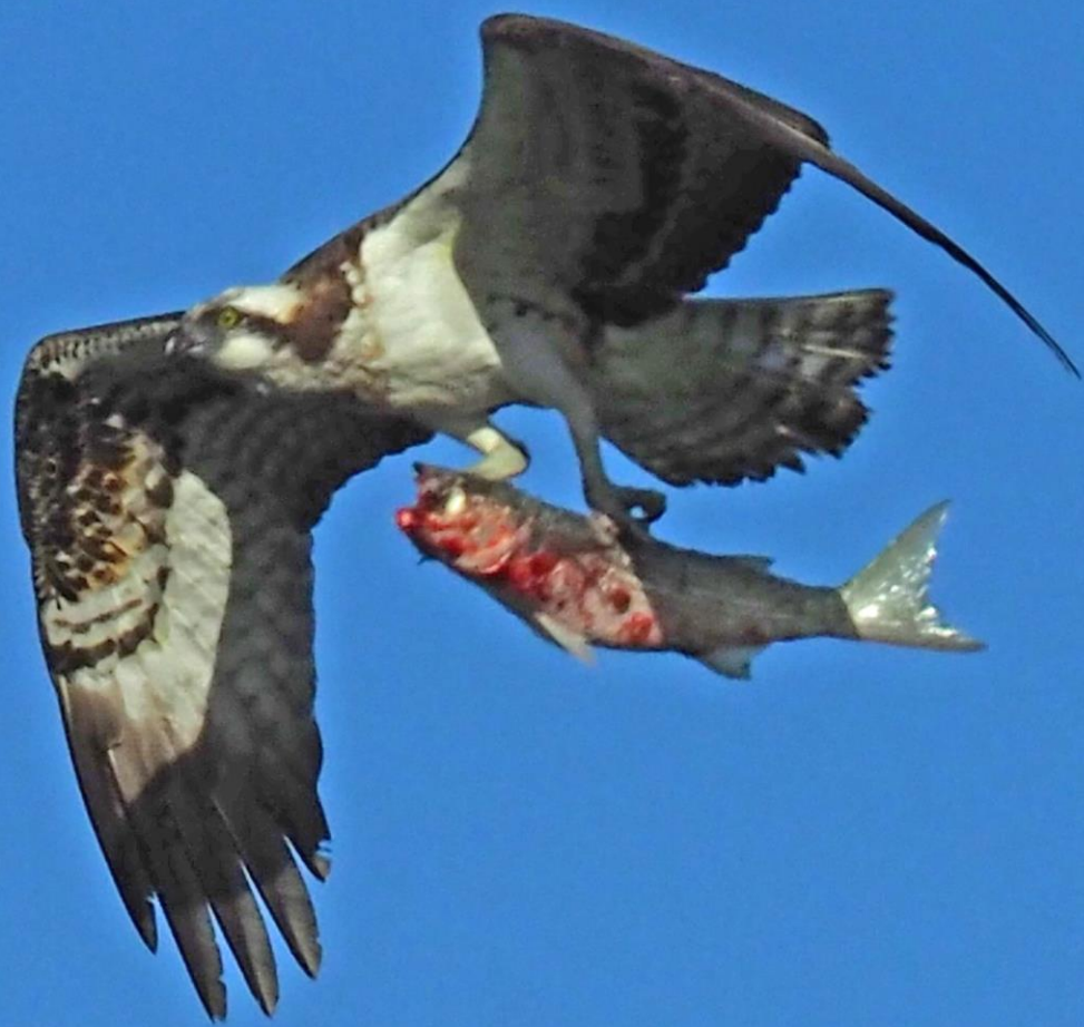
ミサゴ（鵜） ワシタカ科 L=メス64cm