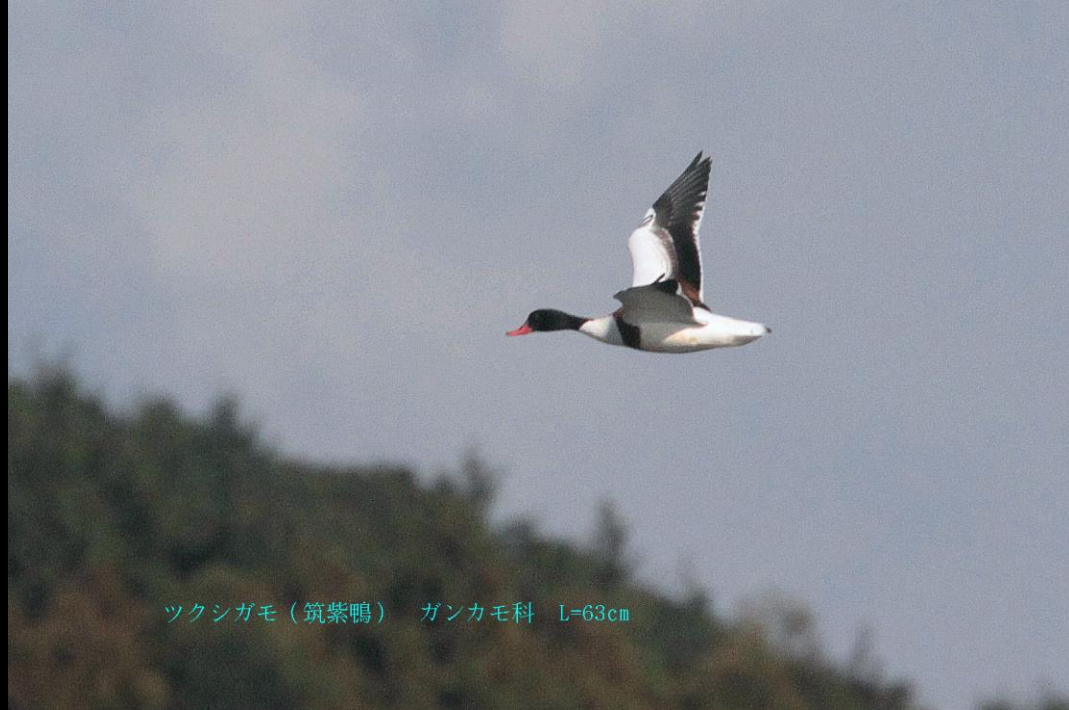
ツクシガモ (筑紫鴨) ガンカモ科 L=63cm