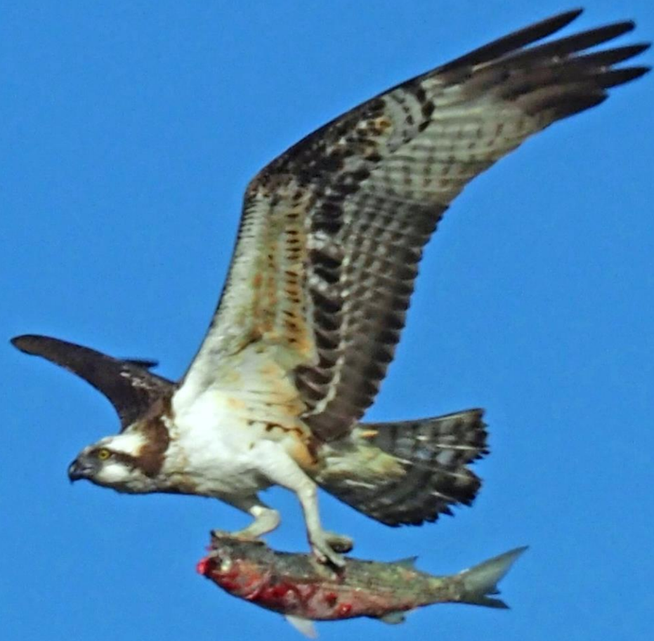
ミサゴ（鵟） ワシタカ科 L=メス64cm