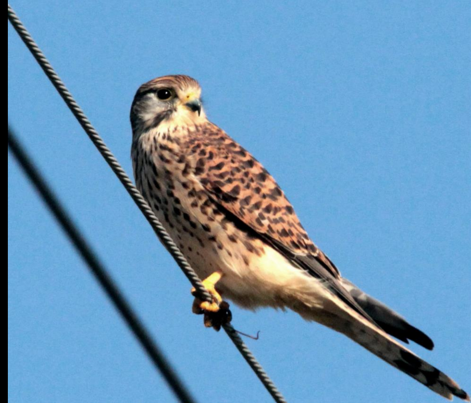
チョウゲンボウ（長元坊） ハヤブサ科 L=メス39cm