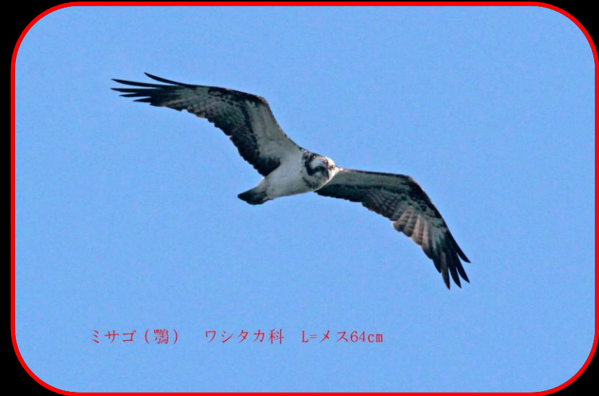
ミサゴ（鶯） ワシタカ科 L=メス64cm