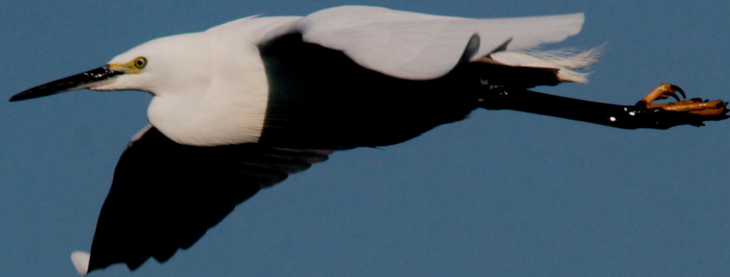
コサギ（小鷺） サギ科 L=61cm