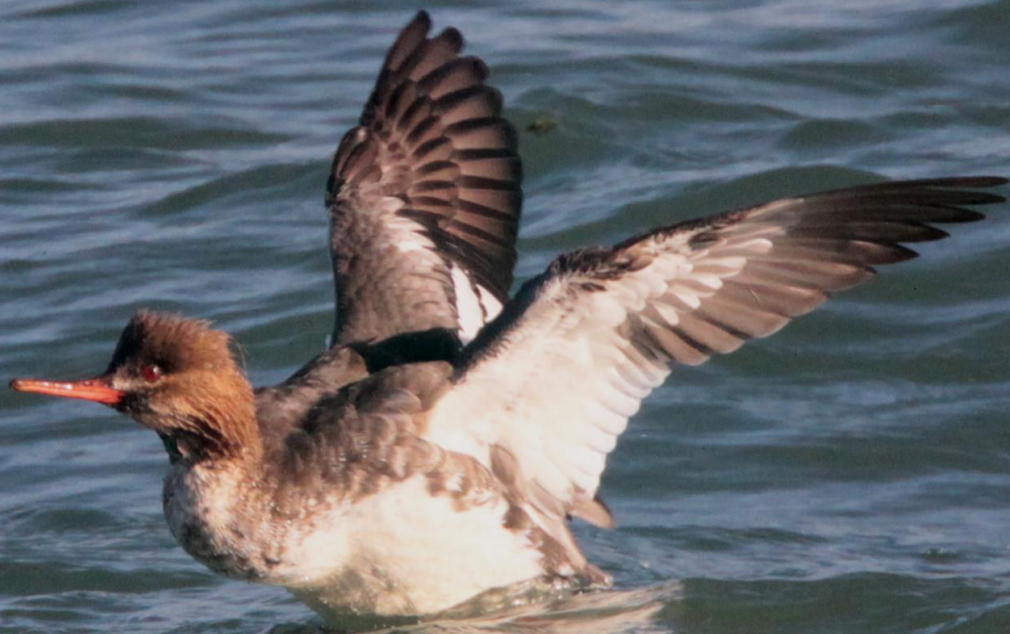
ウミアイサ (海秋沙) メス ガンカモ科 L=55cm