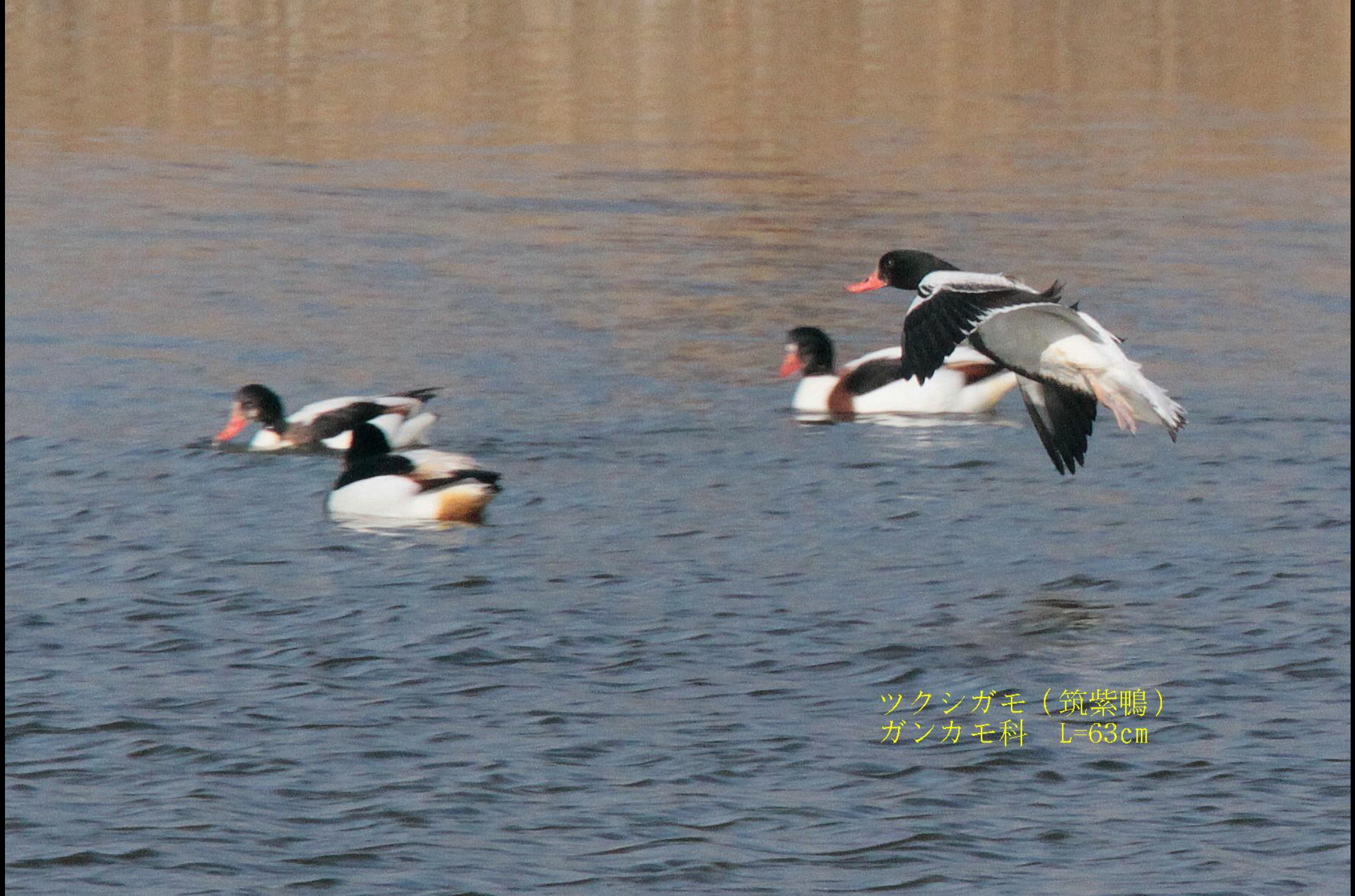
ツクシガモ (筑紫鴨) ガンカモ科 L=63cm