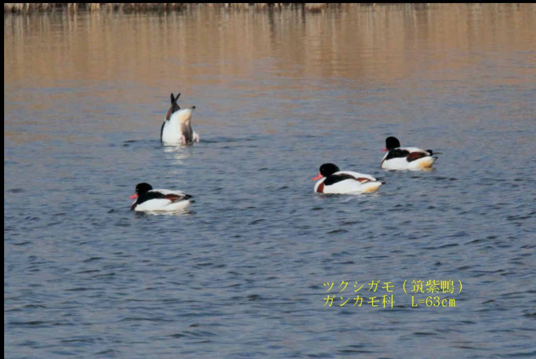
ツクシガモ (筑紫鴨) ガンカモ科 L=63cm