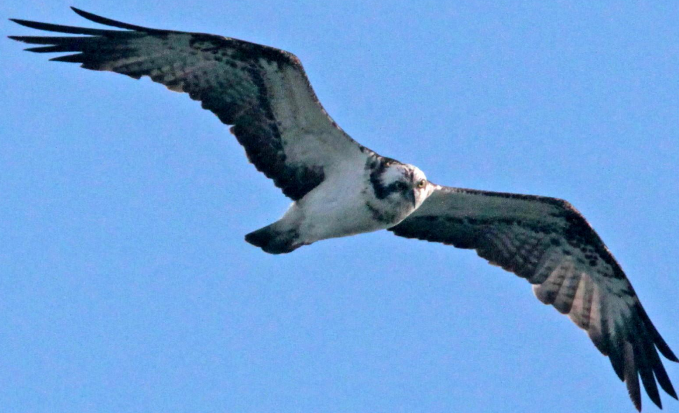
ミサゴ（鵟） ワシタカ科 L=メス64cm