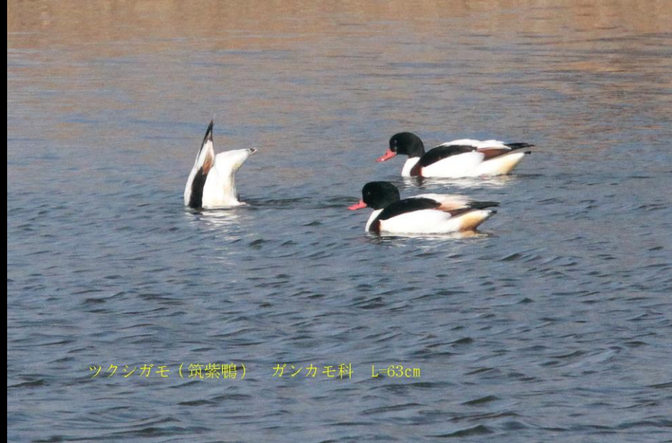
ツクシガモ (筑紫鴨) ガンカモ科 L=63cm