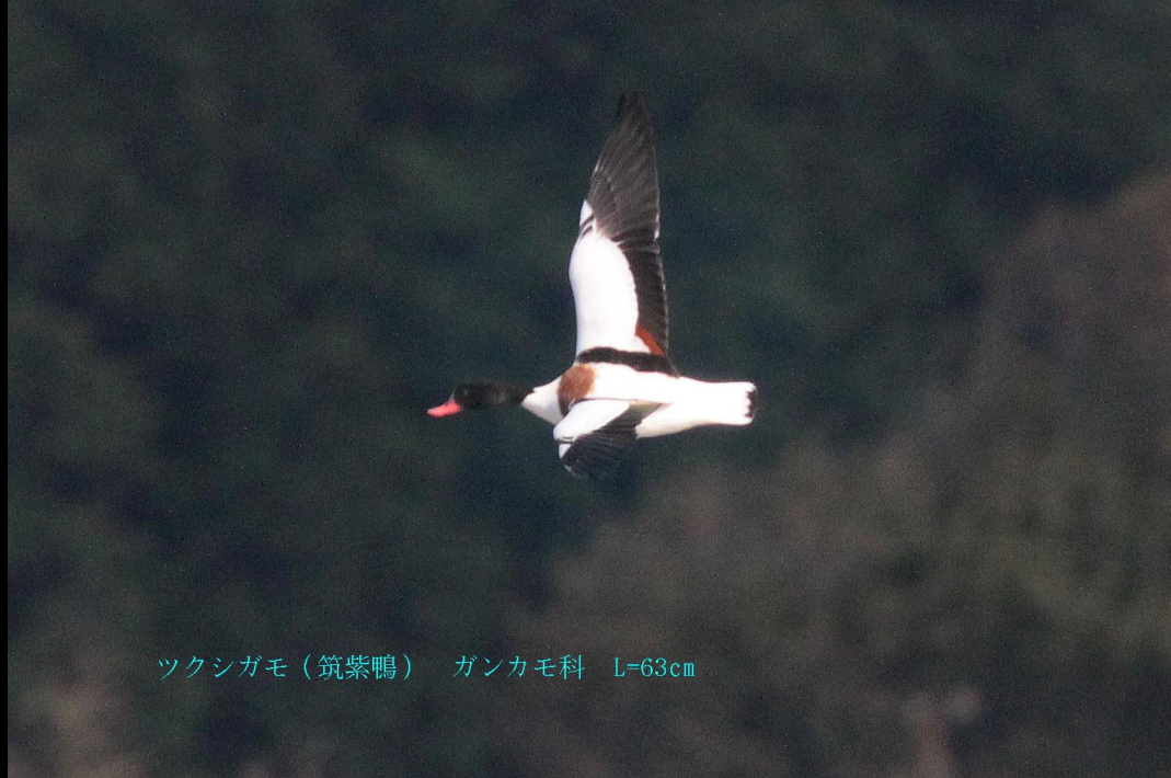
ツクシガモ (筑紫鴨) ガンカモ科 L=63cm