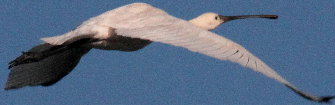
ヘラサギ（篋鷺） トキ科 L=86cm