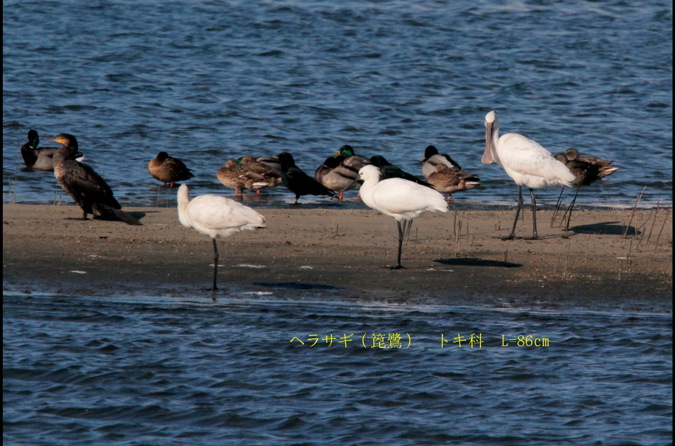
ヘラサギ（篋鷺） トキ科 L=86cm