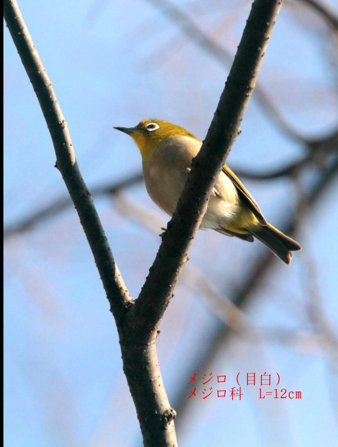
メジロ (目白) メジロ科 L=12cm