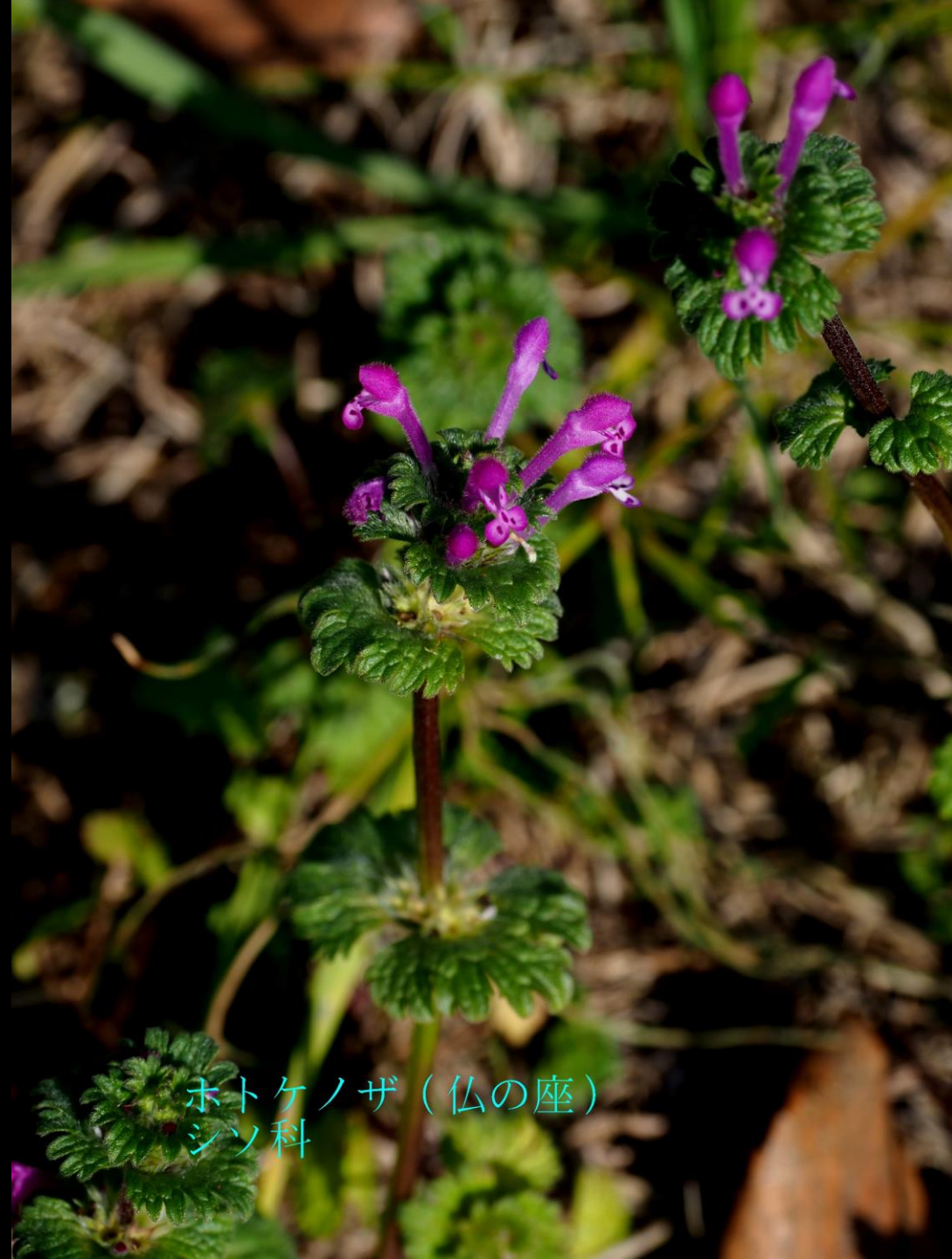
ホトケノザ（仏の座） シソ科