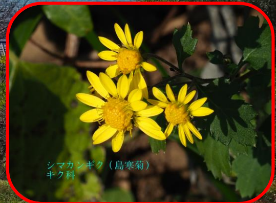
シマカンギク (島寒菊) キク科