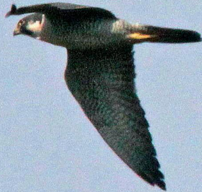
ハヤブサ（隼）ハヤブサ科 L=オス42cm