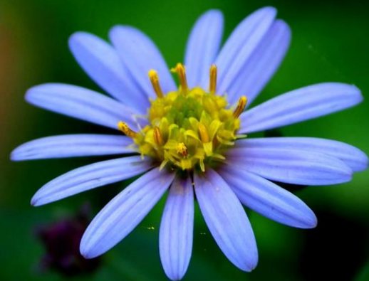
ヨメナ (嫁菜) キク科