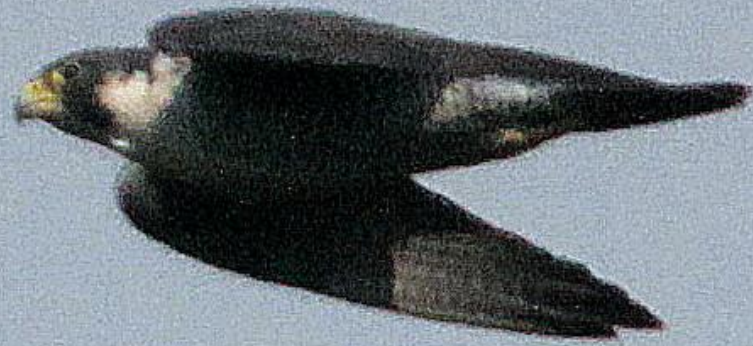
ハヤブサ (隼) ハヤブサ科 L=オス42cm