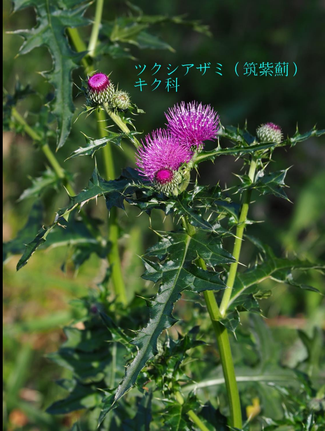
ツクシアザミ (筑紫薊) キク科