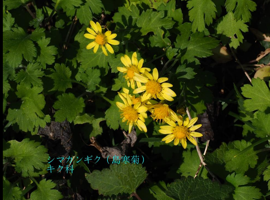
シマカンギク (島寒菊) キク科