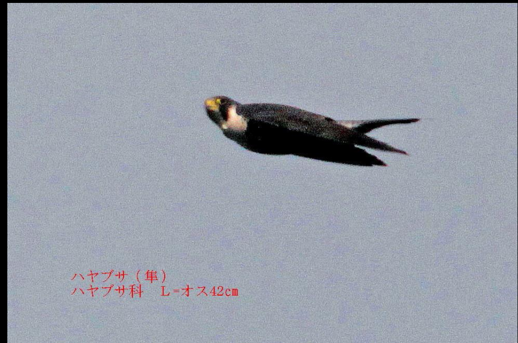
ハヤブサ（隼） ハヤブサ科 L=オス42cm