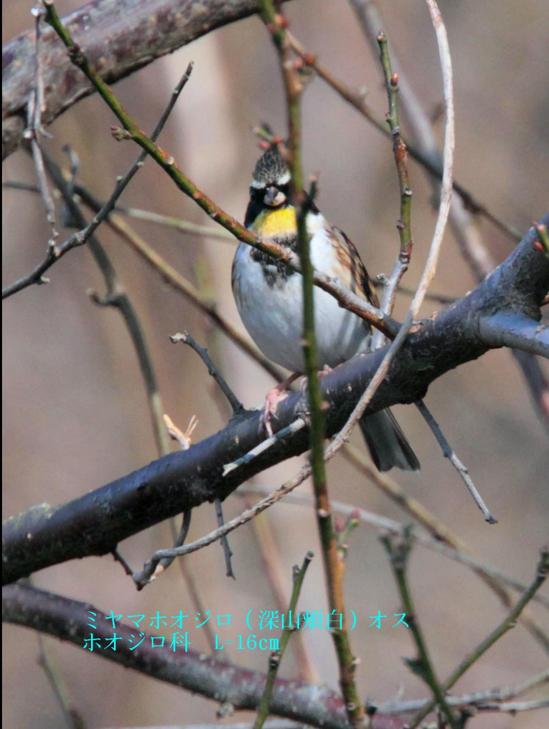
ミヤマホオジロ (深山頬白) オス ホオジロ科 L=16cm