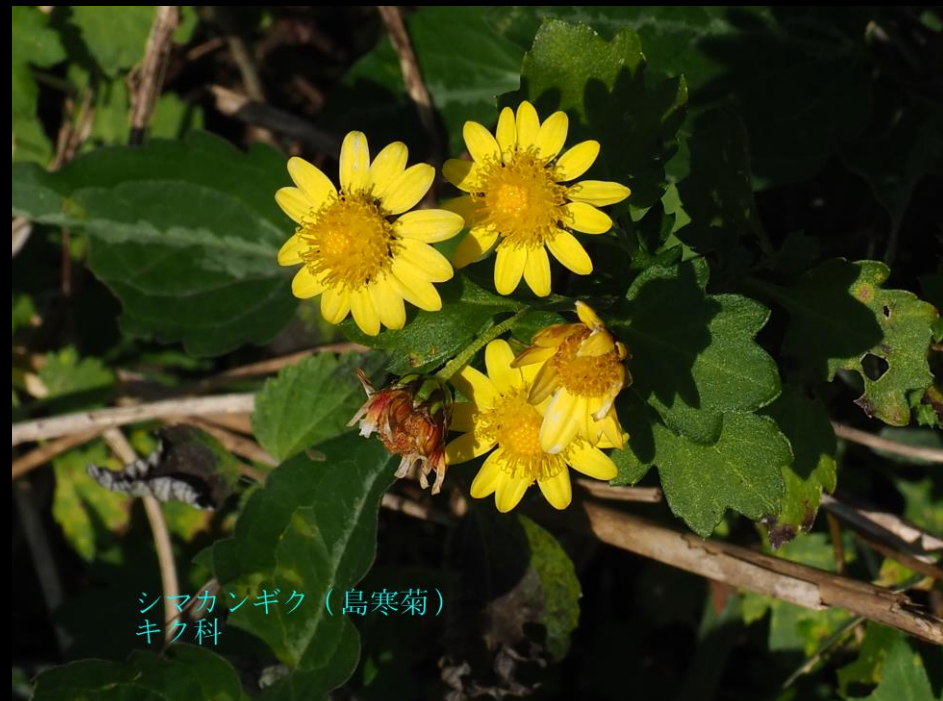
シマカンギク (島寒菊) キク科