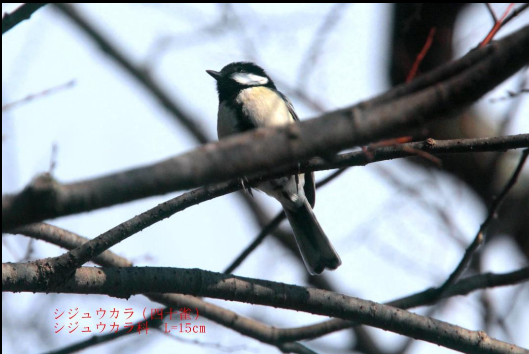
シジュウカラ (四十雀) シジュウカラ科 L=15cm