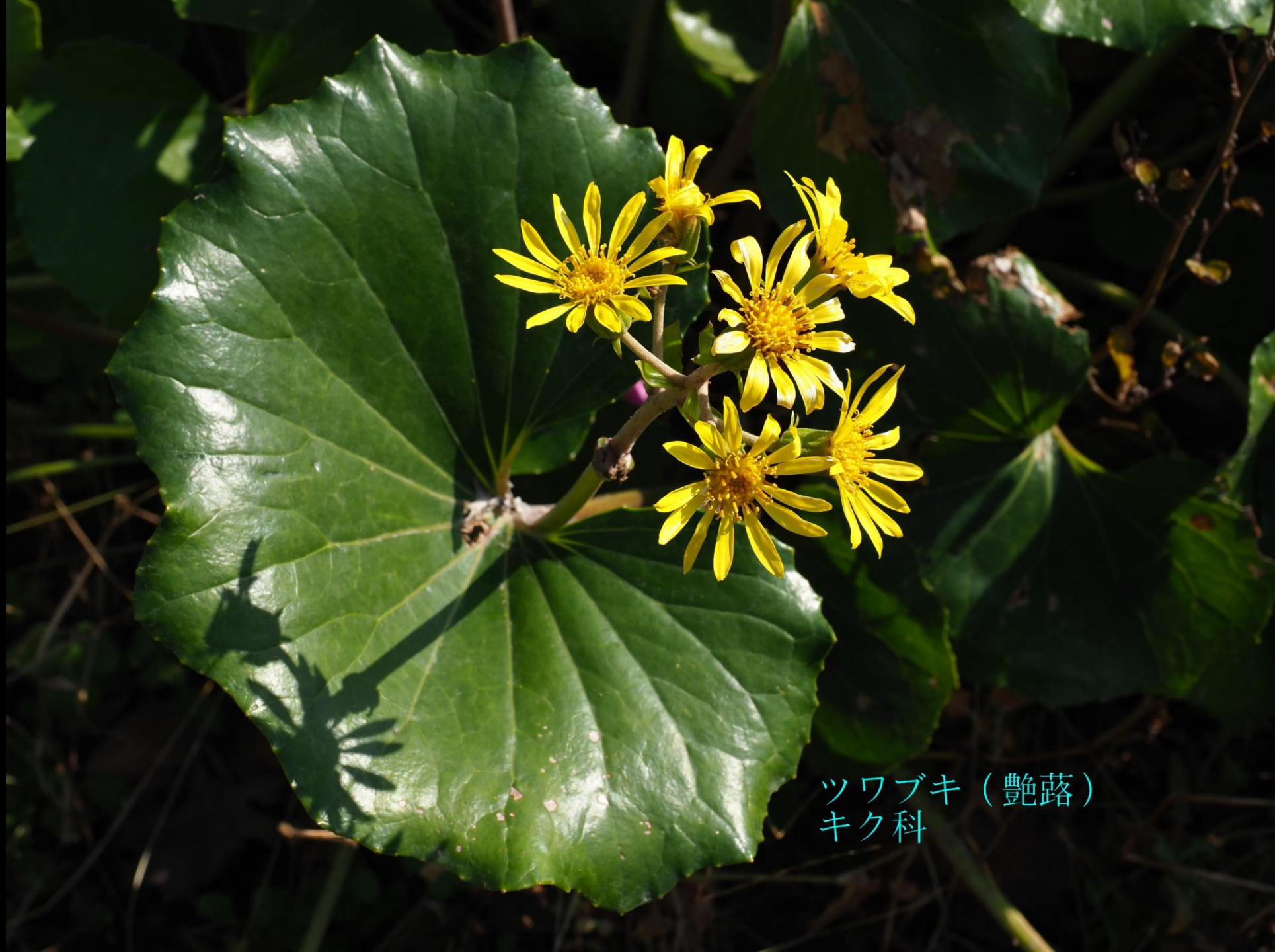
ツワブキ (艶落) キク科