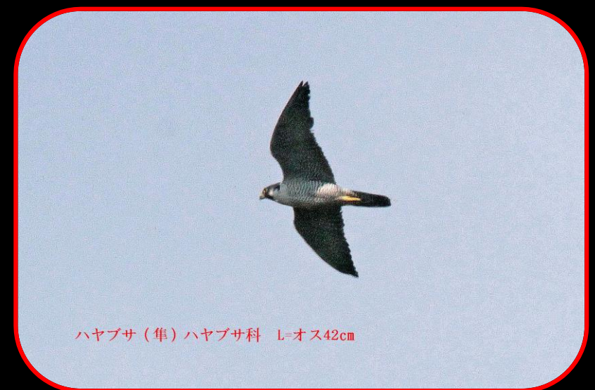
ハヤブサ (隼) ハヤブサ科 L=オス42cm