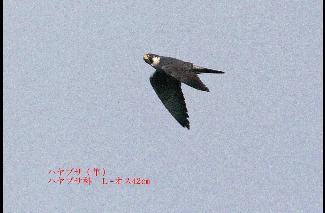
ハヤブサ（隼） ハヤブサ科 L=オス42cm