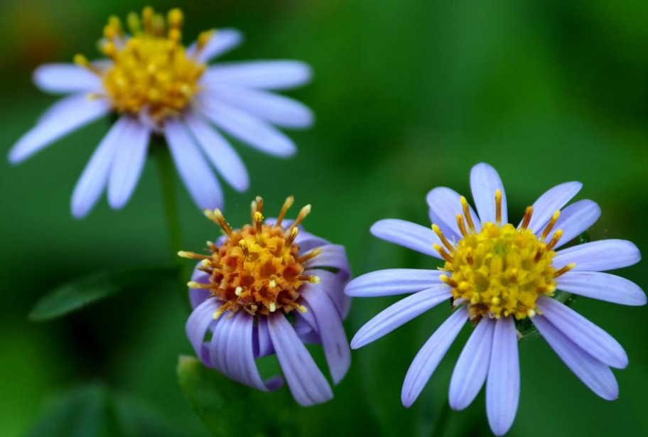
ヨメナ (嫁菜) キク科