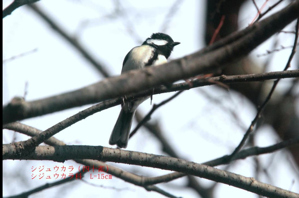
シジュウカラ (四十雀) シジュウカラ科 L=15cm