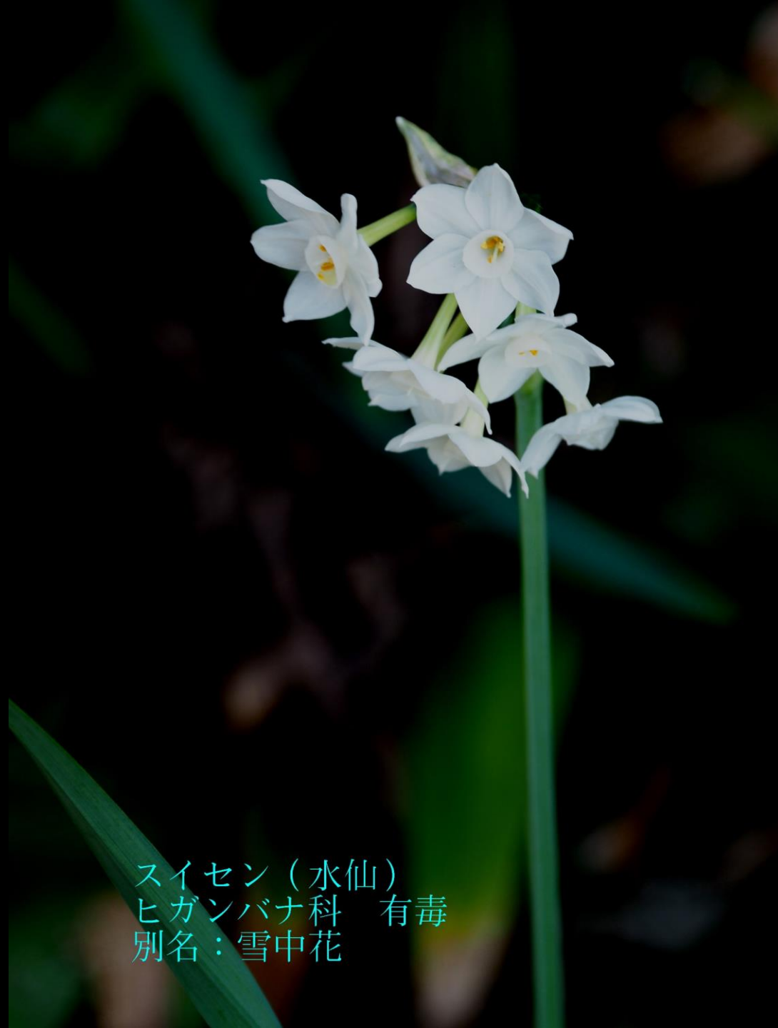
スイセン（水仙） ヒガンバナ科 有毒 別名：雪中花