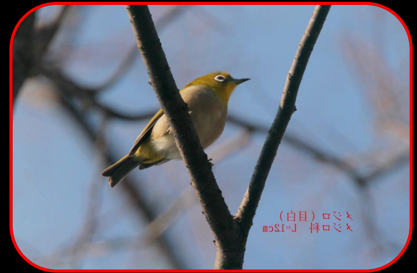
(白目) ロシメ mSI=L 挿ロシメ