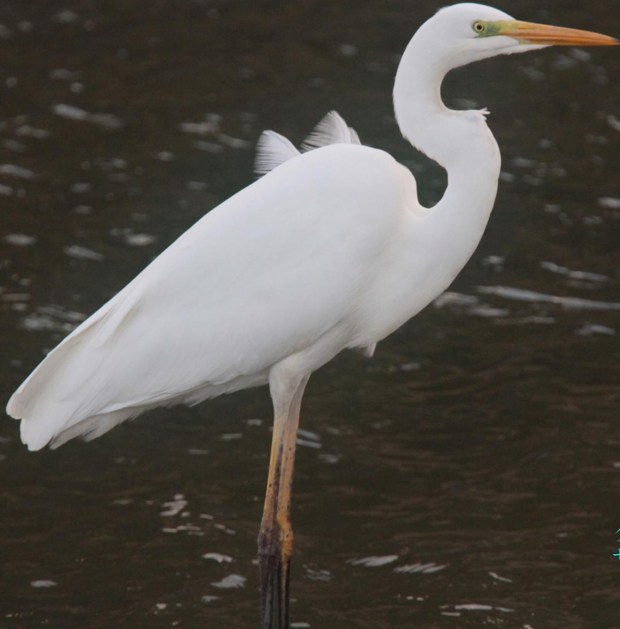
ダイサギ（大鷺） サギ科 L=90cm