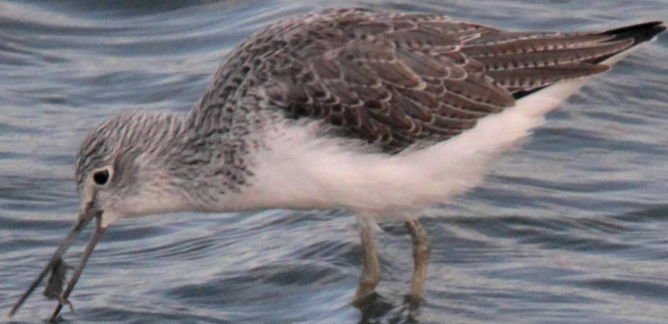
アオアシシギ（蒼脚鷗） シギ科 L=35cm