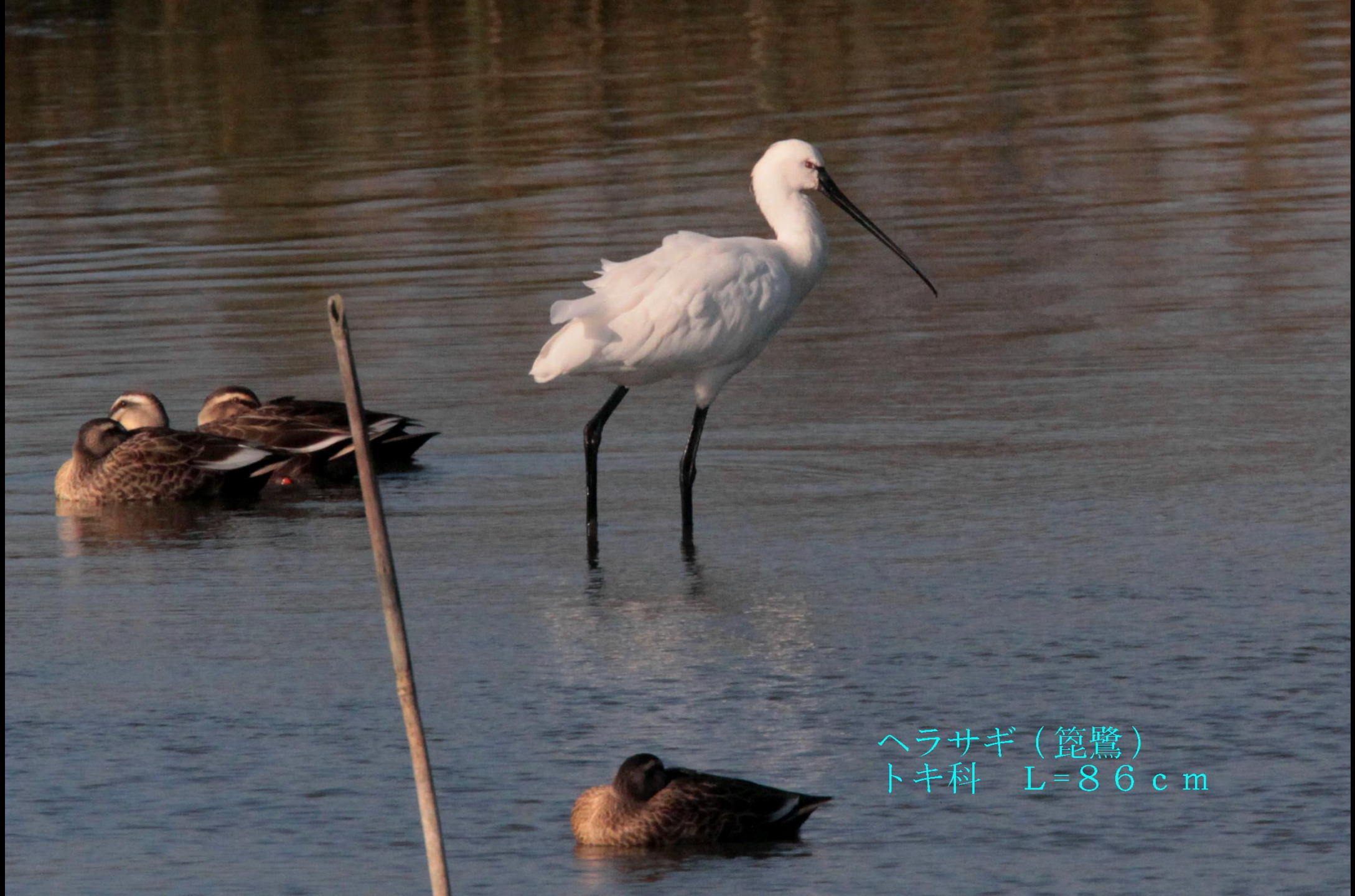
ヘラサギ（篋鷺） トキ科 L=86cm