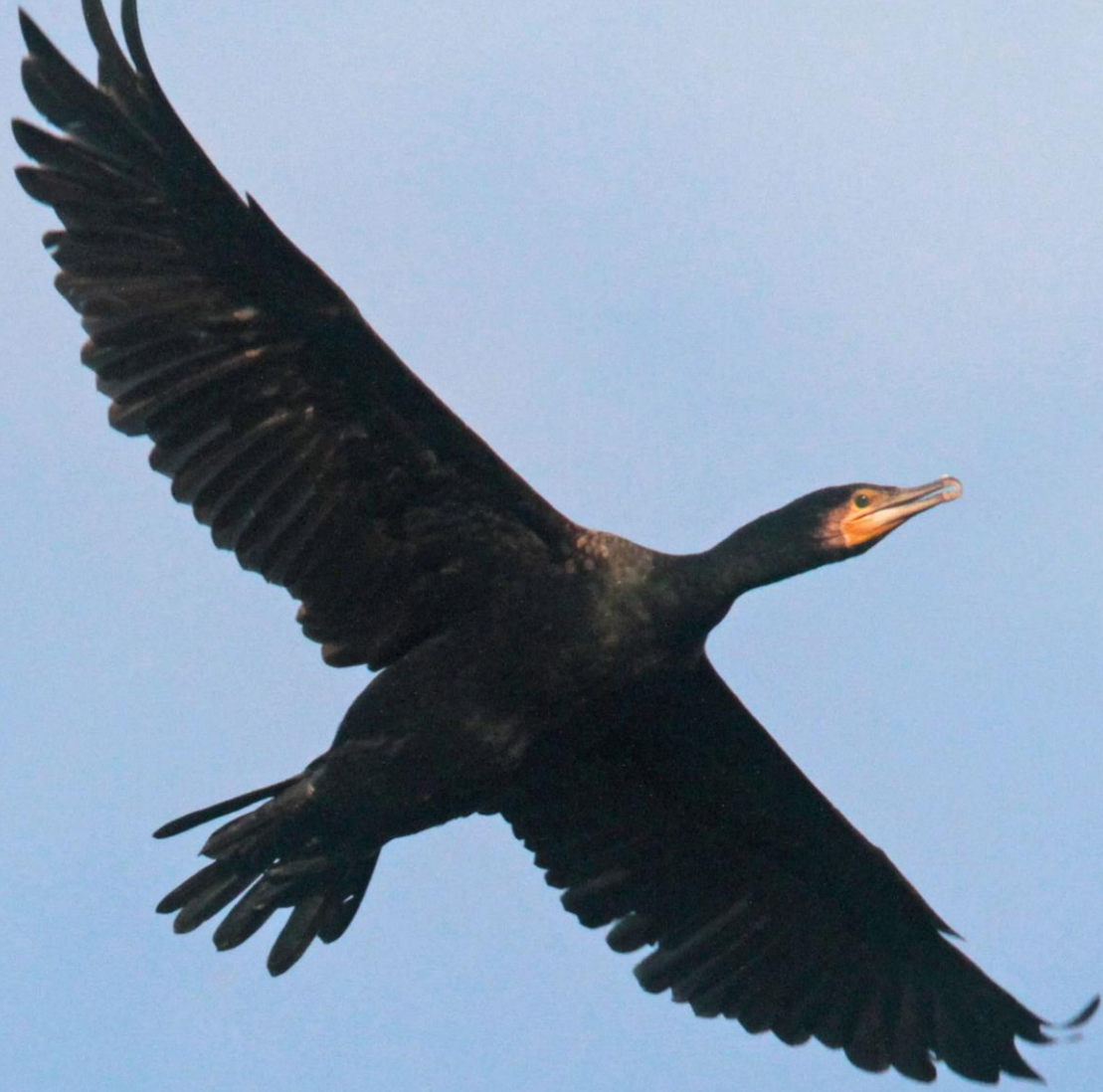
カワウ（河鵜） ウ科 L=82cm