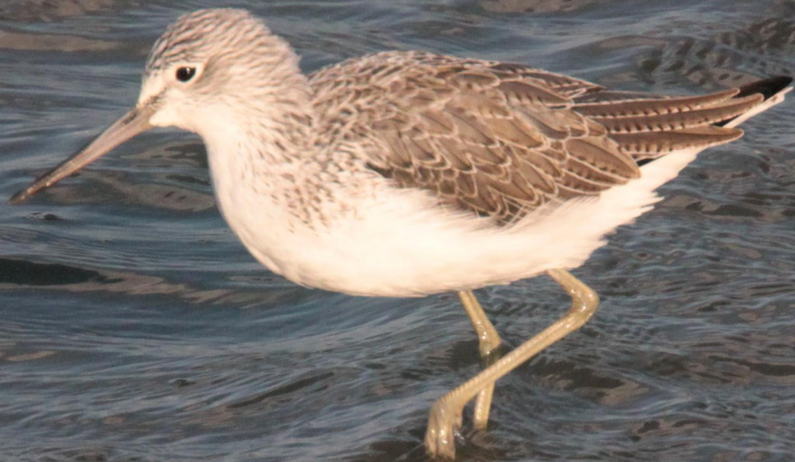
アオアシシギ（蒼脚鷗） シギ科 L=35cm