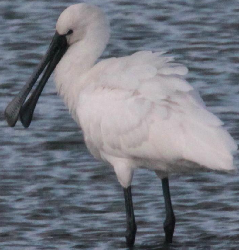
ヘラサギ (篋鷺) トキ科 L=86cm