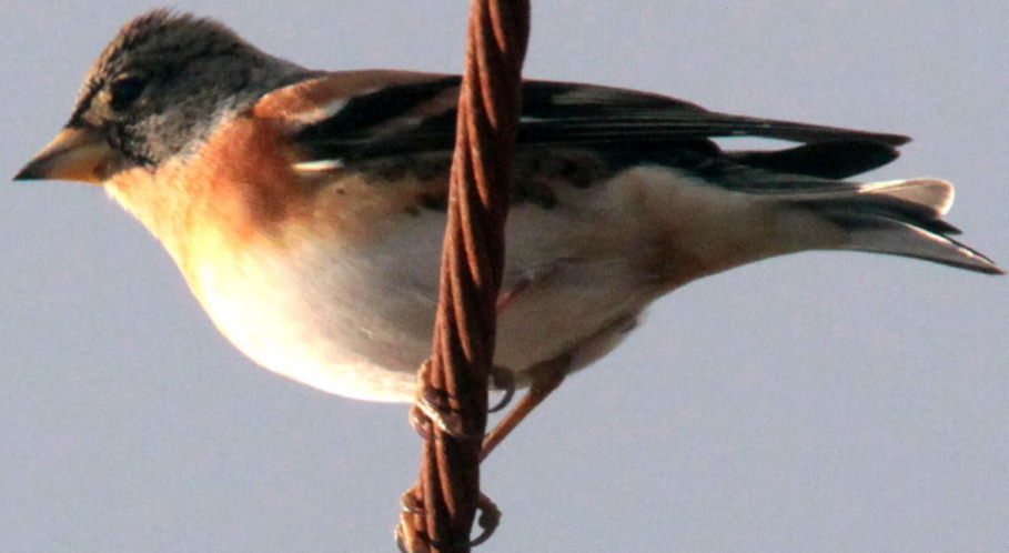
アトリ(花鶏) アトリ科 L=16cm