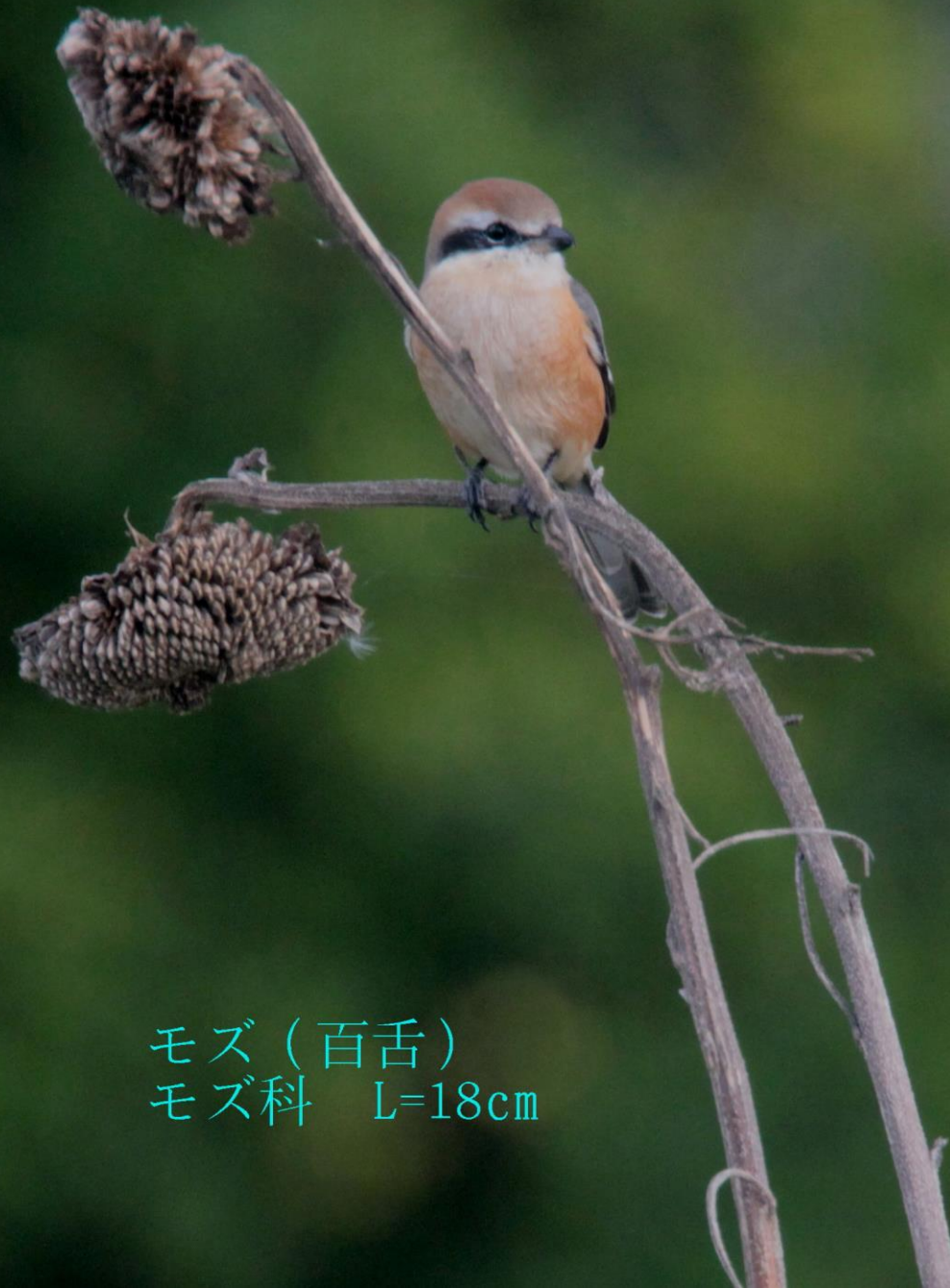
モズ（百舌） モズ科 L=18cm