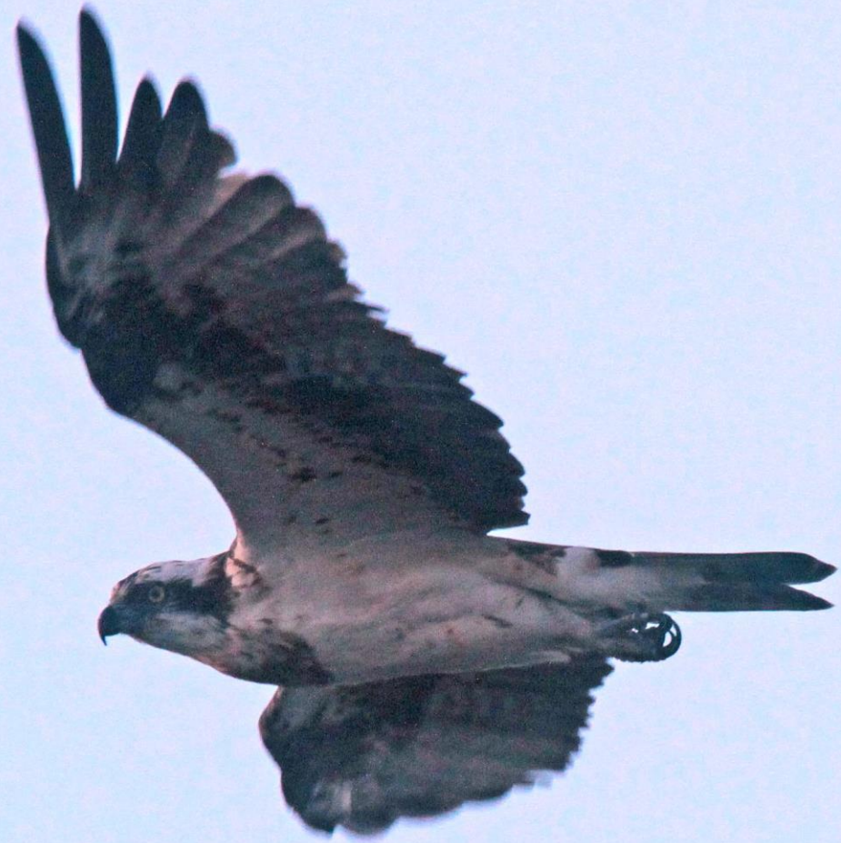
ミサゴ（鵟） ワシタカ科 L=メス64cm