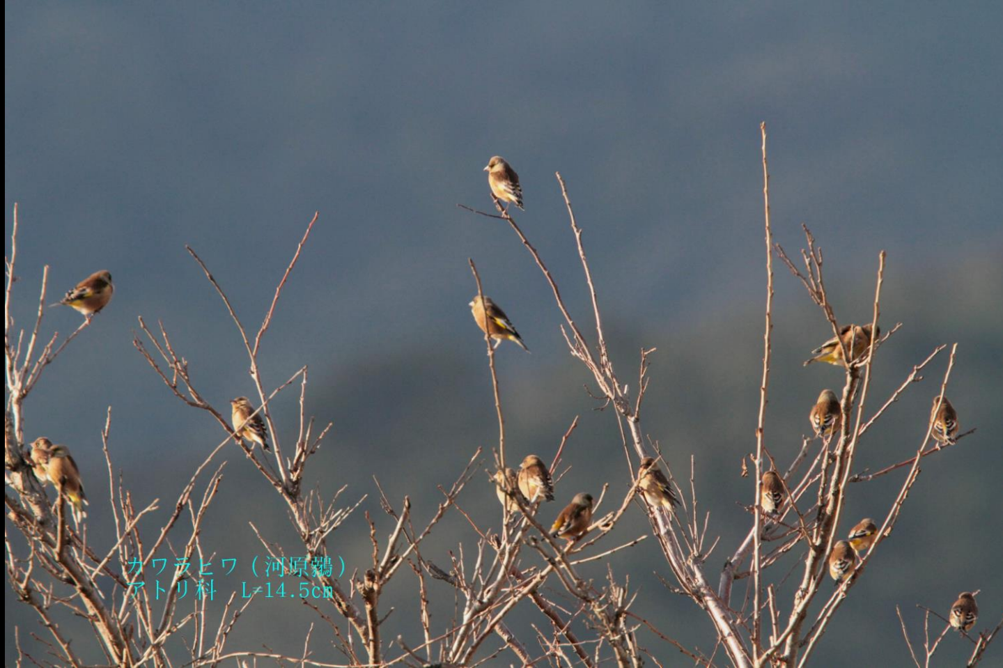
カワチヒワ (河原鶉) アトリ科 L=14.5cm