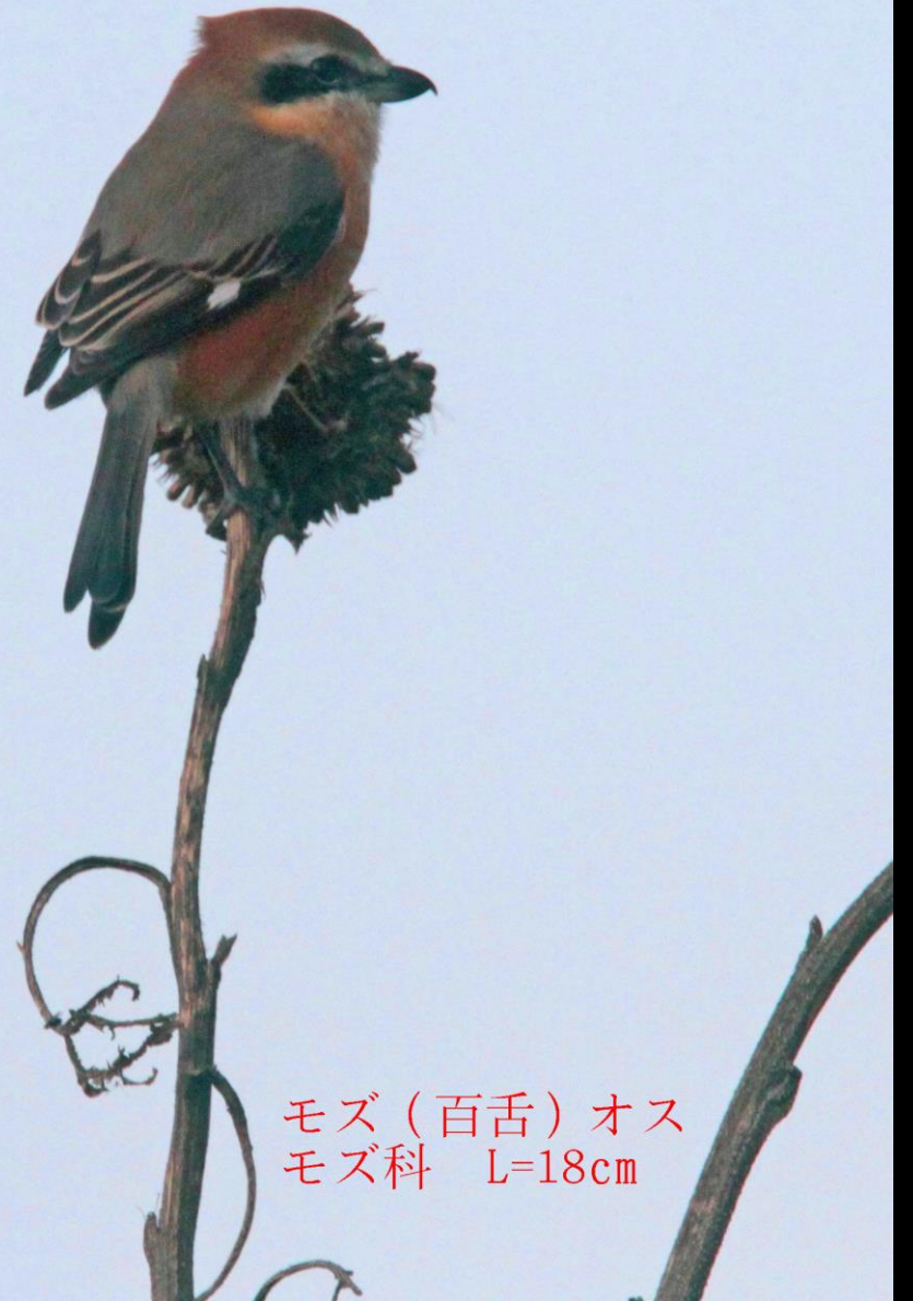
モズ（百舌）オス モズ科 L=18cm