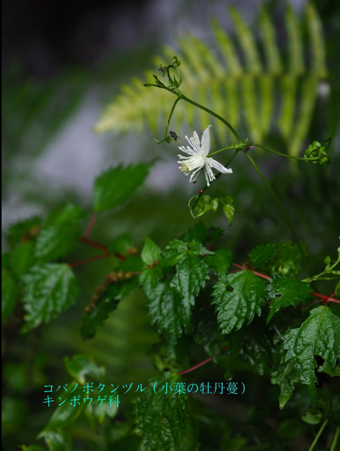
コバノボタンヅル（小葉の牡丹蔓） キンポウゲ科