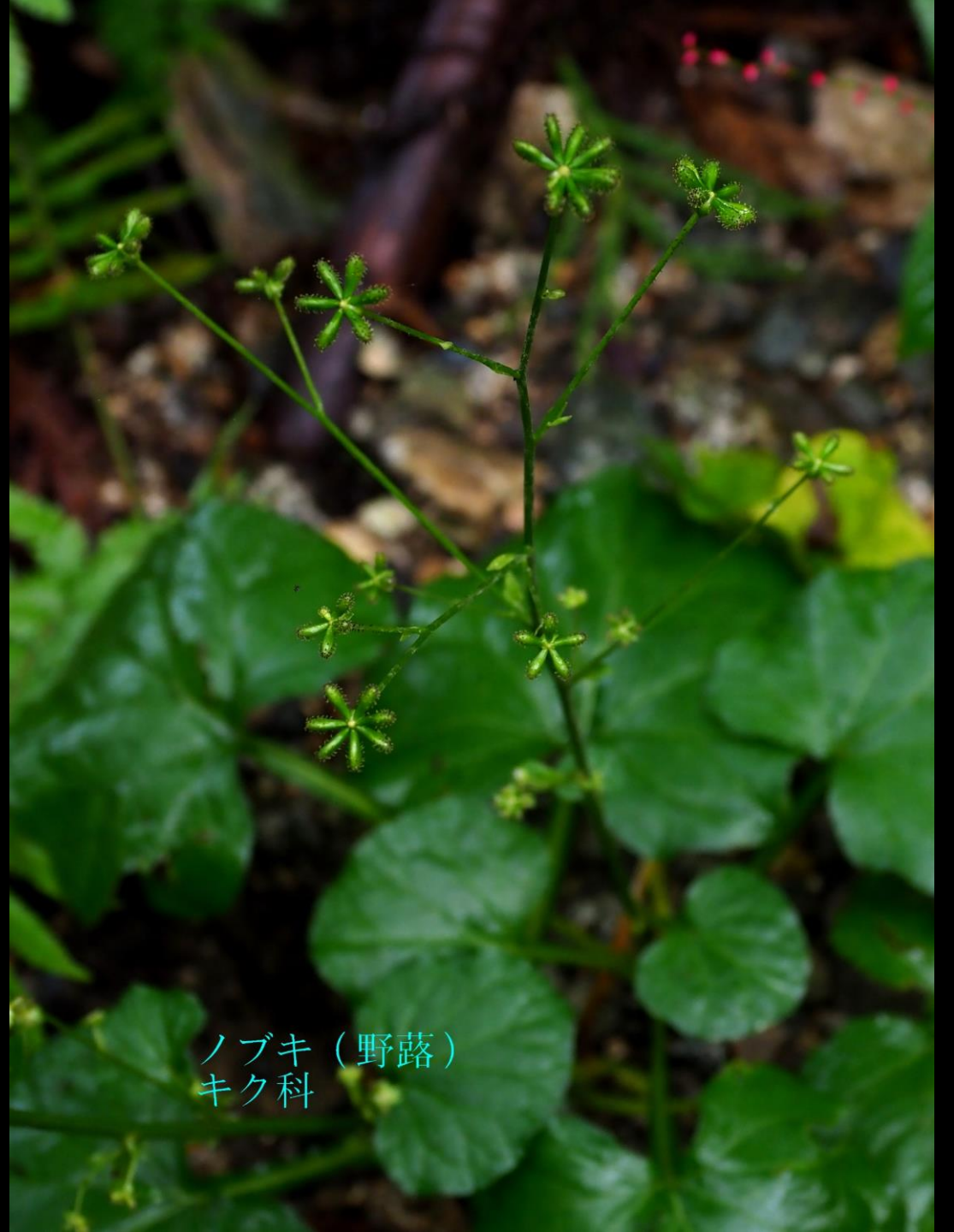
ノブキ (野蔭) キク科