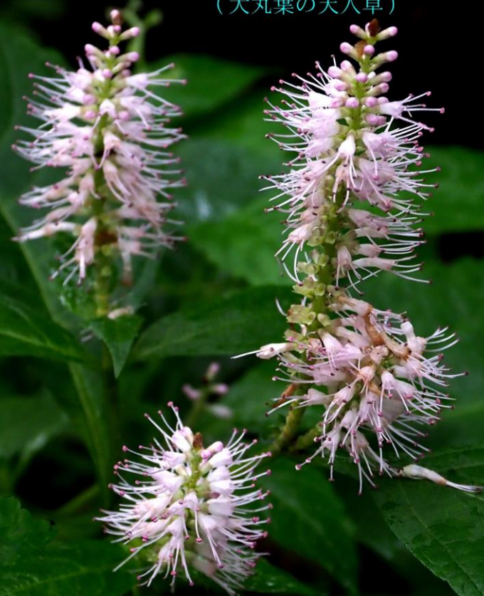
ツクシミカエリソウ (筑紫見返草) シソ科 別名: オオマルバノテンニンソウ (大丸葉の天人草)