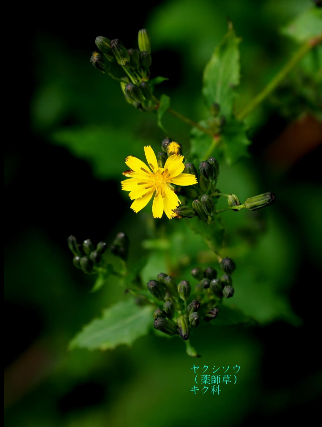
ヤクシソウ (薬師草) キク科