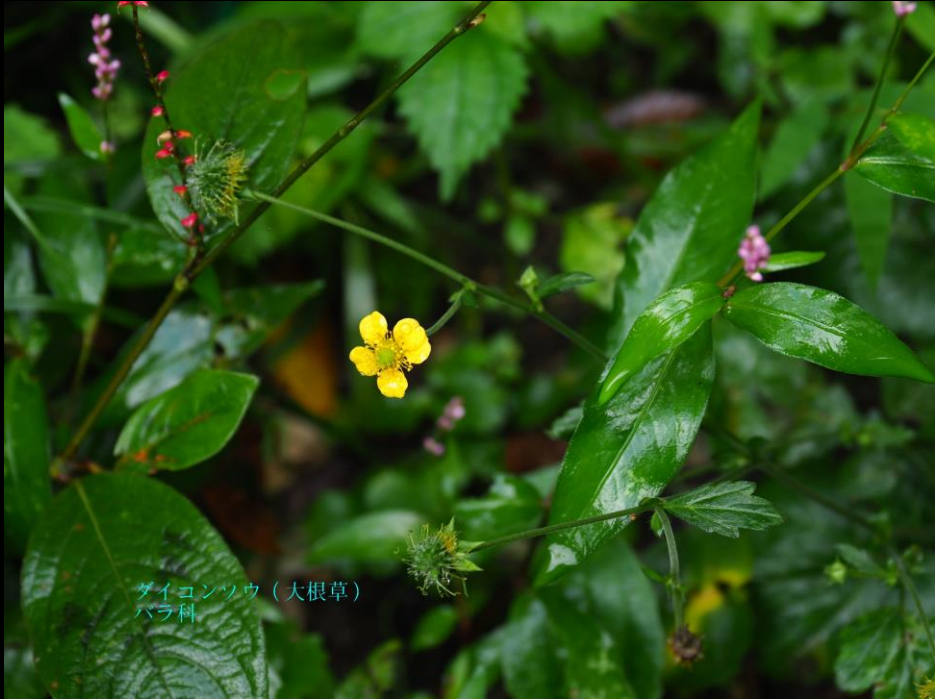
ダイコンソウ (大根草) バラ科