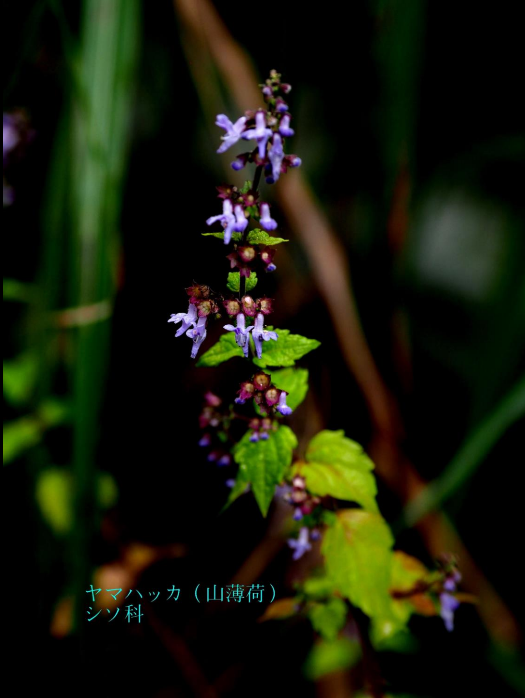
ヤマハッカ (山薄荷) シソ科