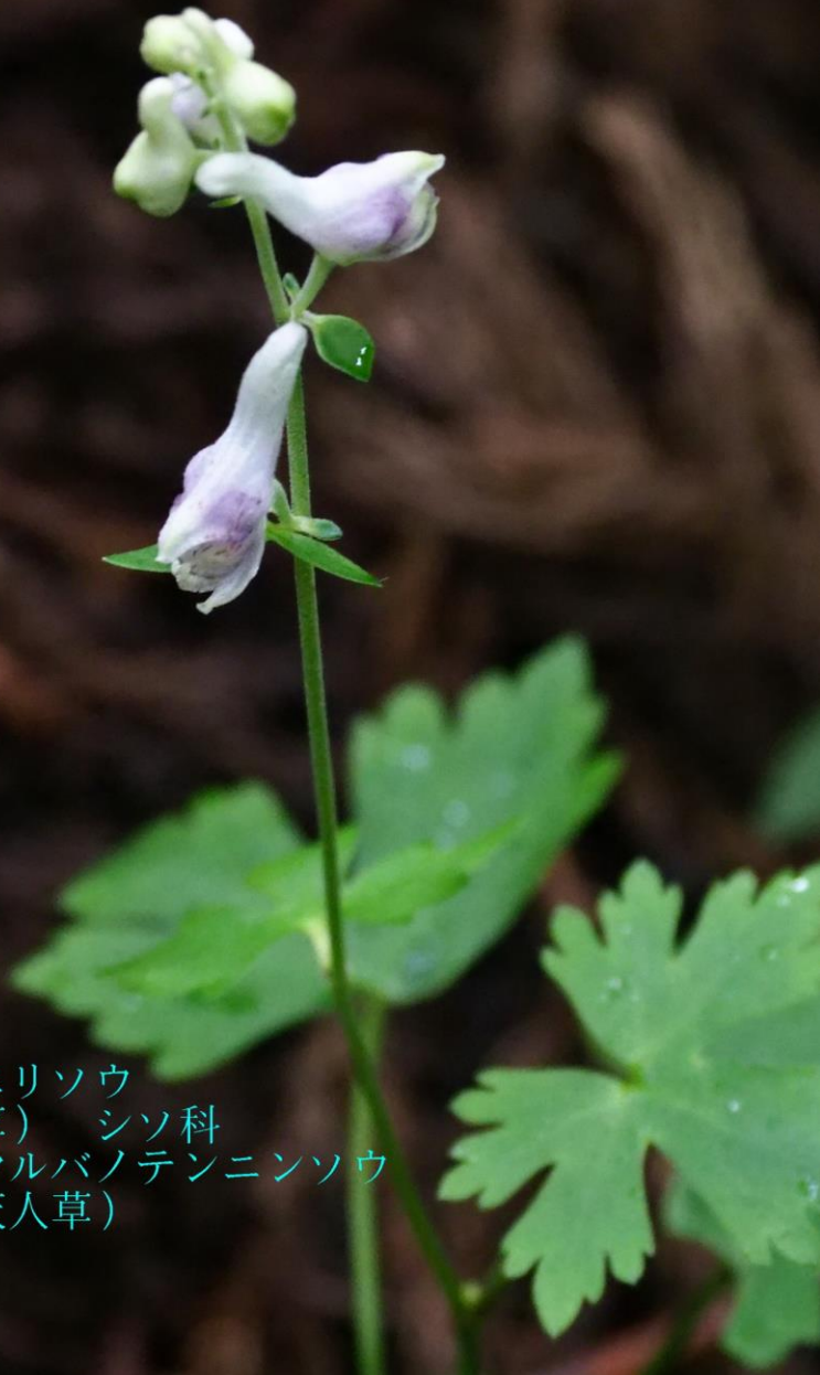
ツクシミカエリソウ (筑紫見返草) シソ科 別名：オオマルバノテンニンソウ (大丸葉の天人草)