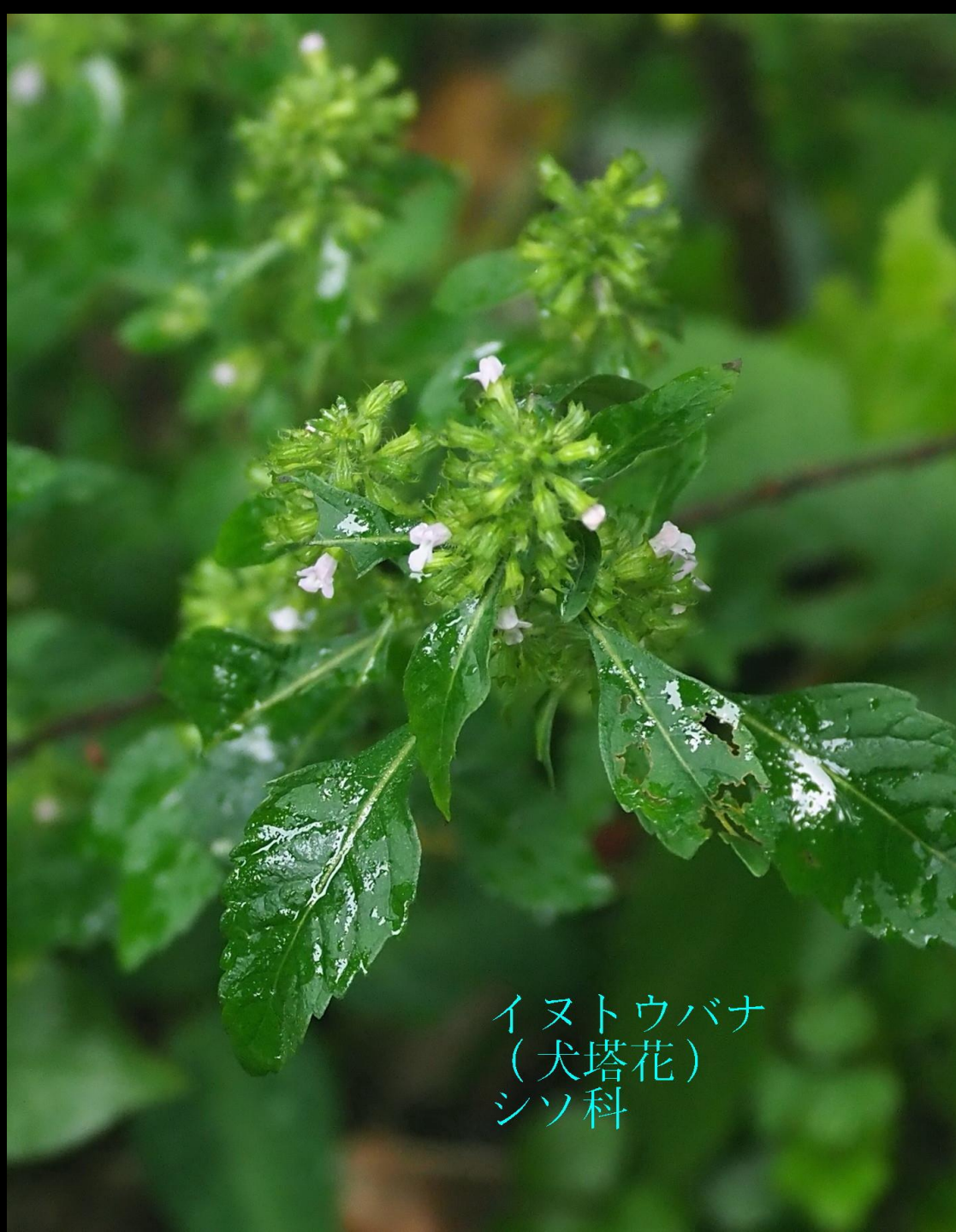
イヌトウバナ (犬塔花) シソ科