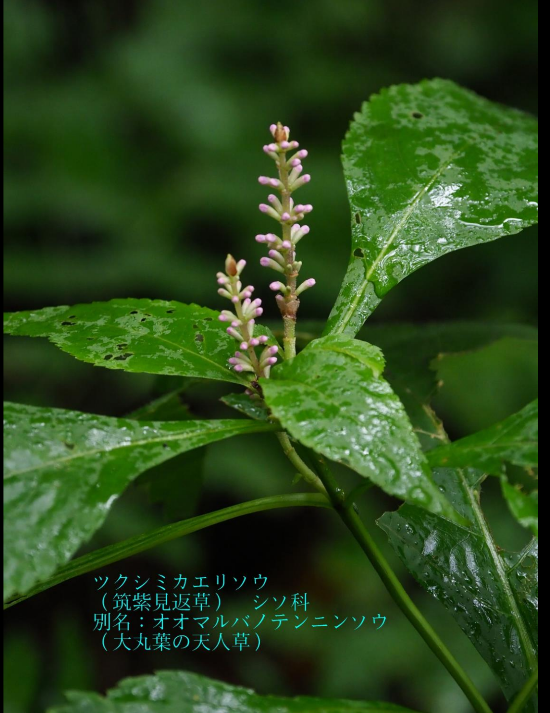
ツクシミカエリソウ (筑紫見返草) シソ科 別名：オオマルバノテンニンソウ (大丸葉の天人草)