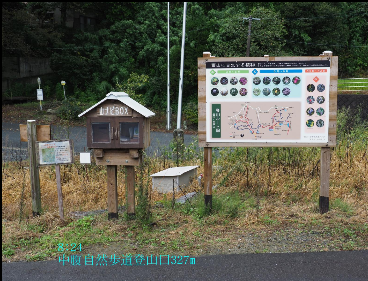
8:24 中腹自然歩道登山口327m