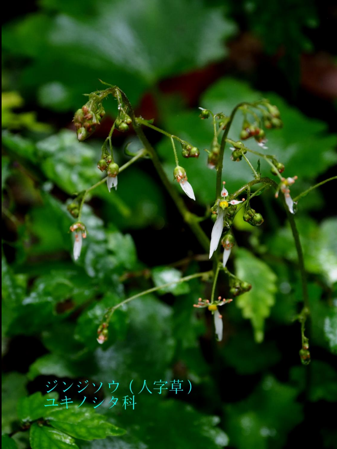
ジンジソウ（人字草） ユキノシタ科