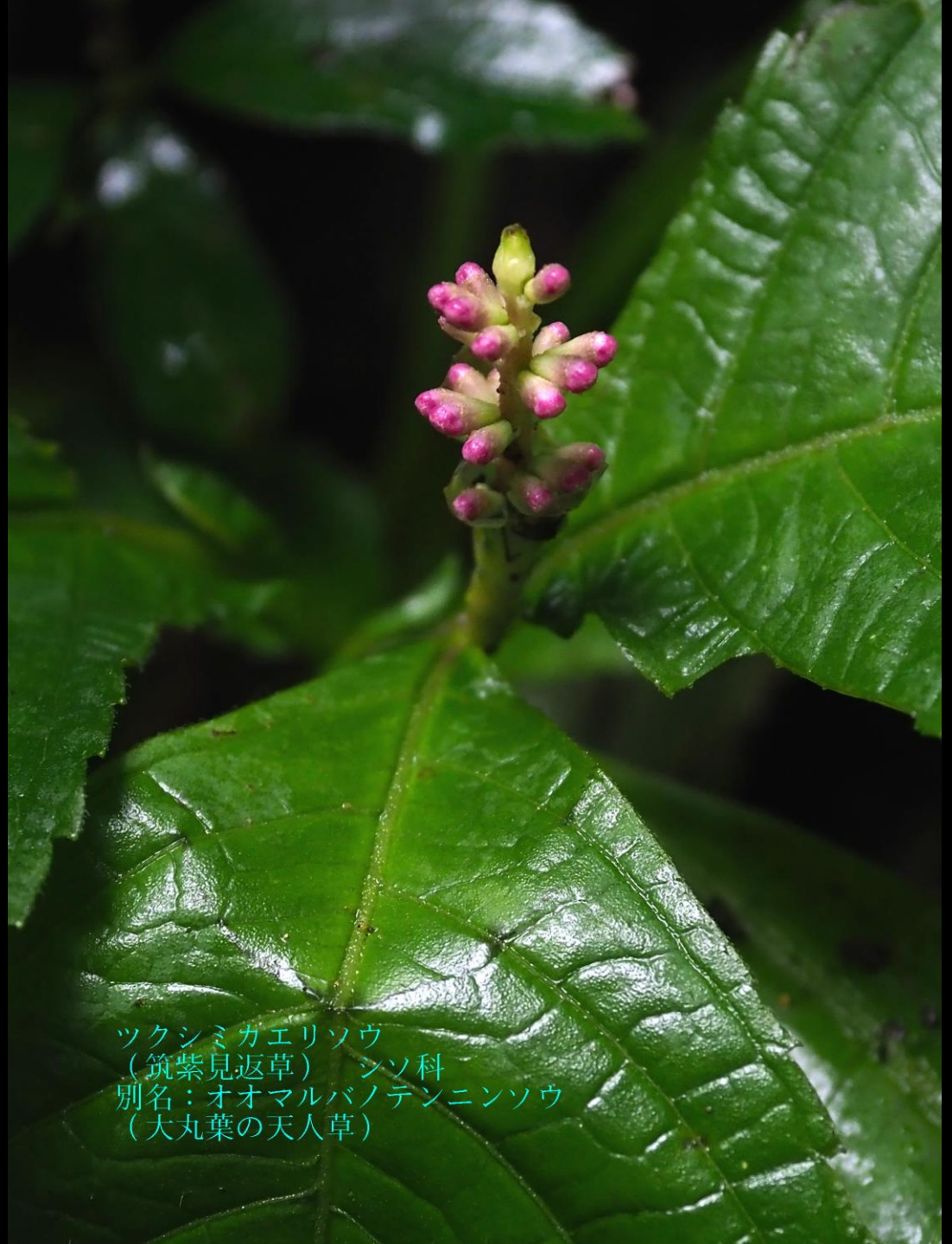
ツクシミガエリソウ (筑紫見返草) シソ科 別名：オオマルバノテンニンソウ (大丸葉の天人草)