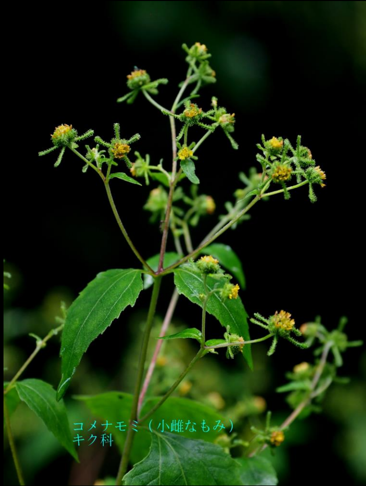
コメナモミ (小雌なもみ) キク科