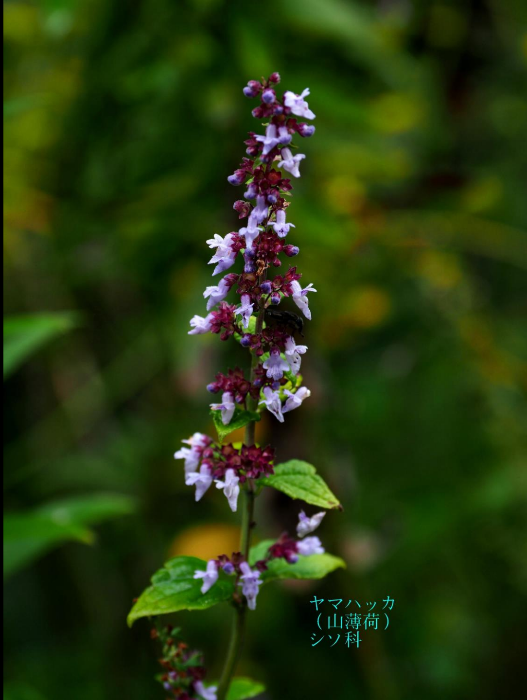
ヤマハッカ (山薄荷) シソ科