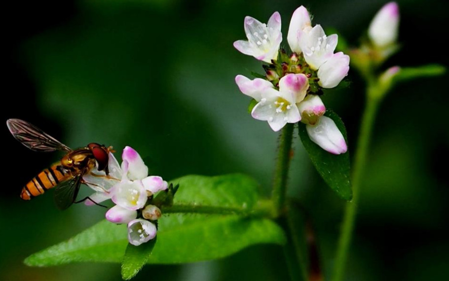
ミゾソバ (溝蕎麦) タデ科