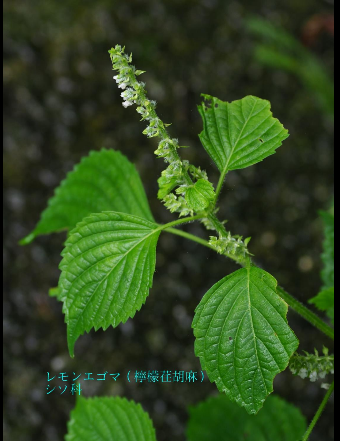
レモンエゴマ（檸檬荳胡麻） シソ科