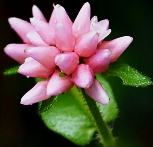
ミゾソバ (溝蕎麦) タデ科