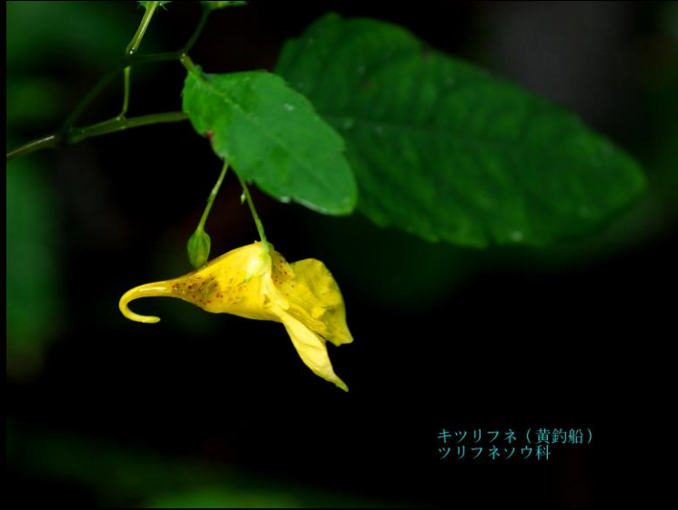
キツリフネ (黄釣船) ツリフネソウ科