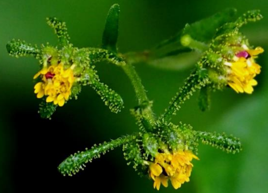
コメナモミ (小雌なもみ) キク科