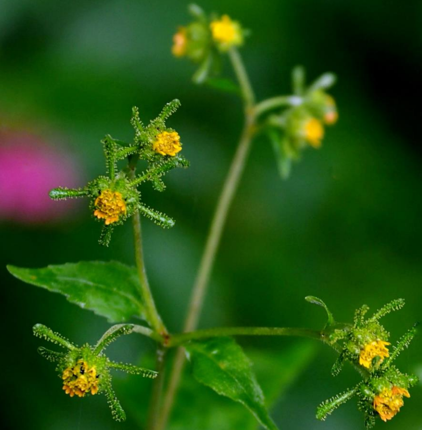
コメナモミ (小雌なもみ) キク科