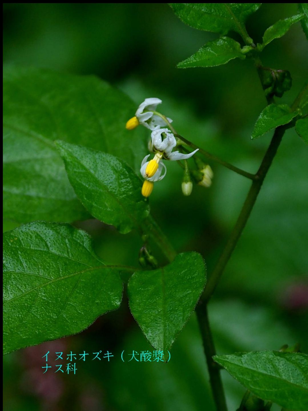
イヌホオズキ (犬酸漿) ナス科