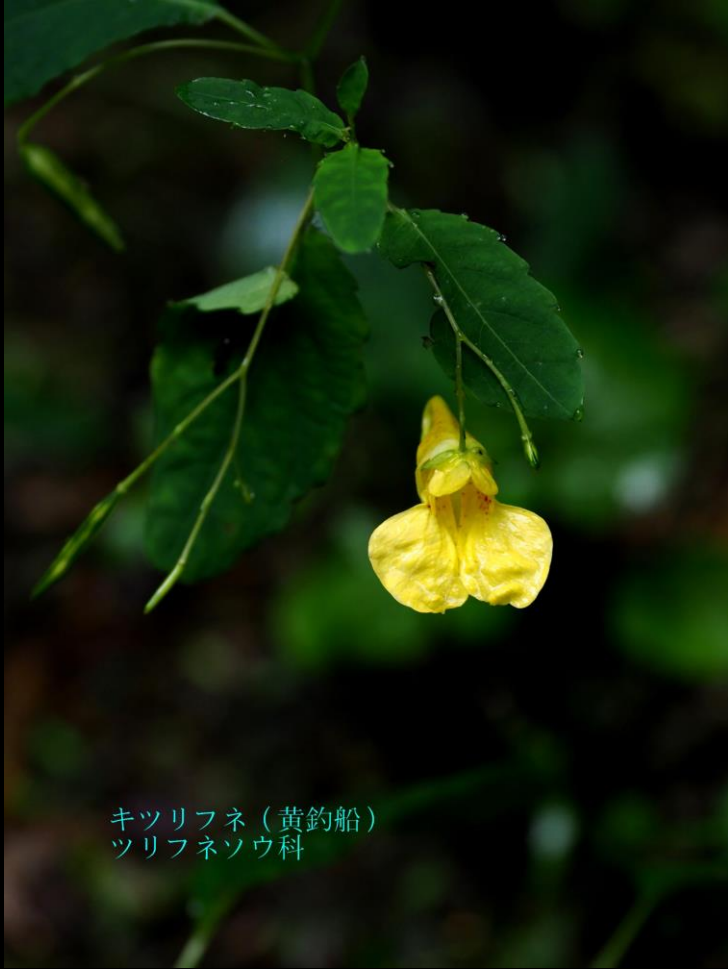
キツリフネ (黄釣船) ツリフネソウ科