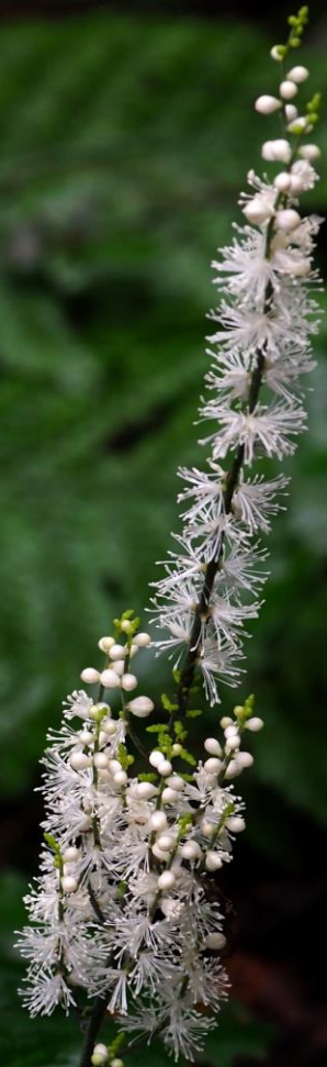
オオバショウマ (大葉升麻) キンポウゲ科