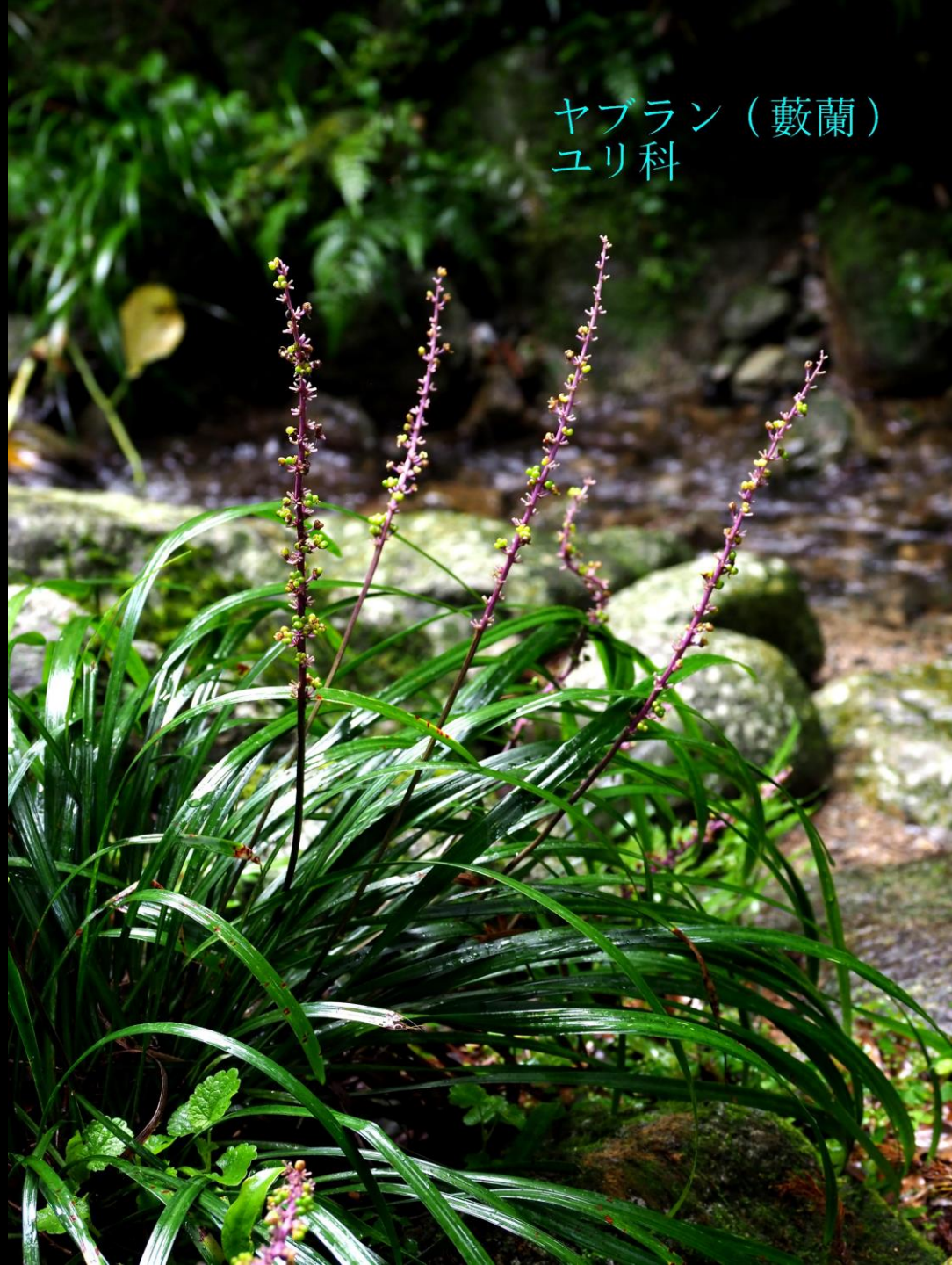
ヤブラン（藪蘭） ユリ科