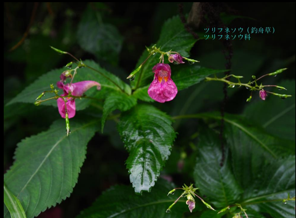
ツリフネソウ (釣舟草) ツリフネソウ科