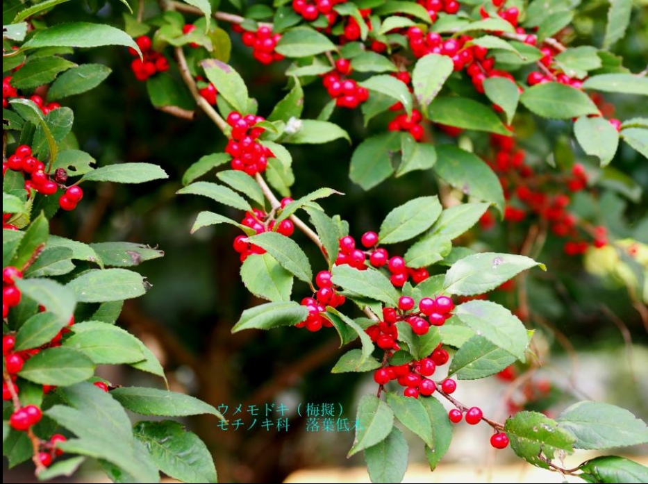
ウメドキ (梅擬) モチノキ科 落葉低木