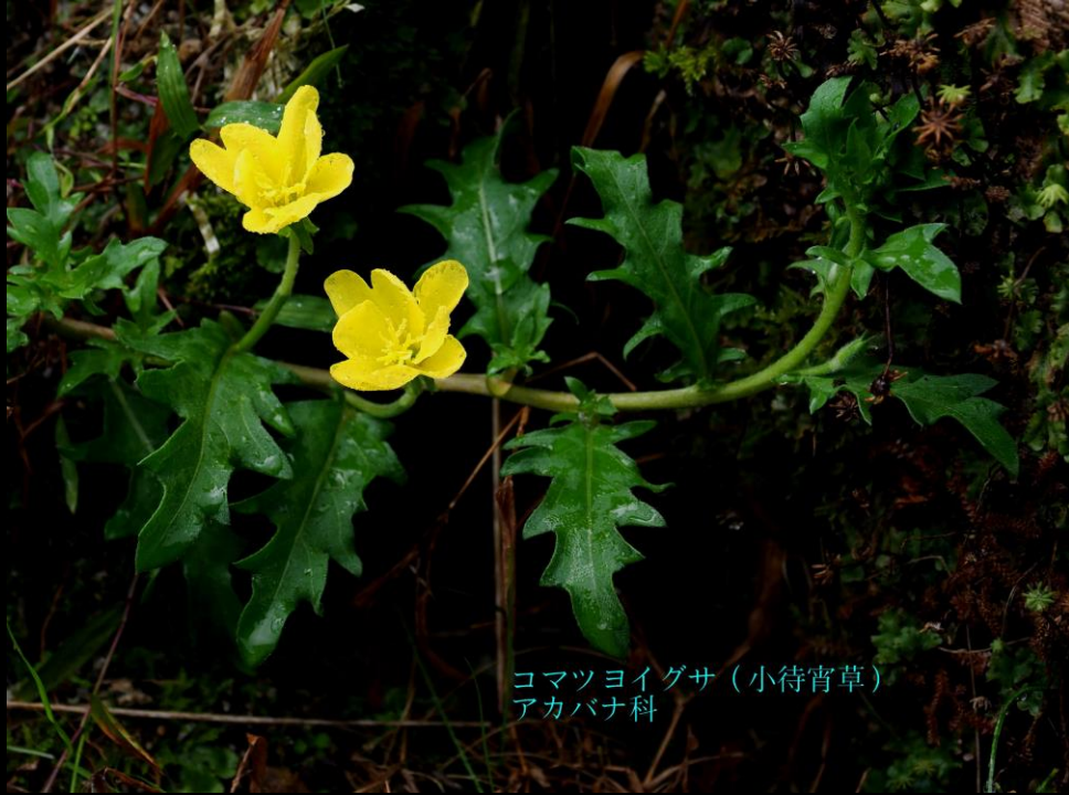
コマツヨイグサ (小待宵草) アカバナ科