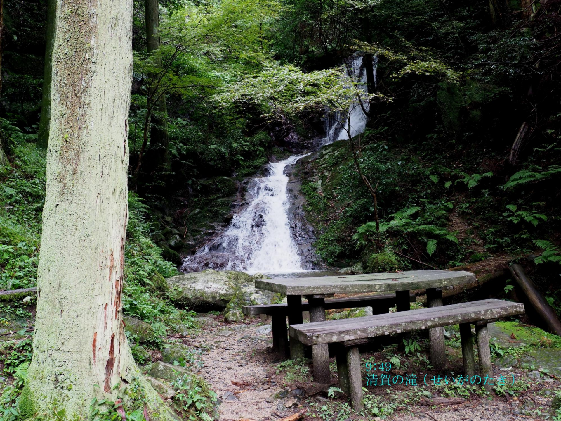
9:49 清賀の滝（せいがのたき）