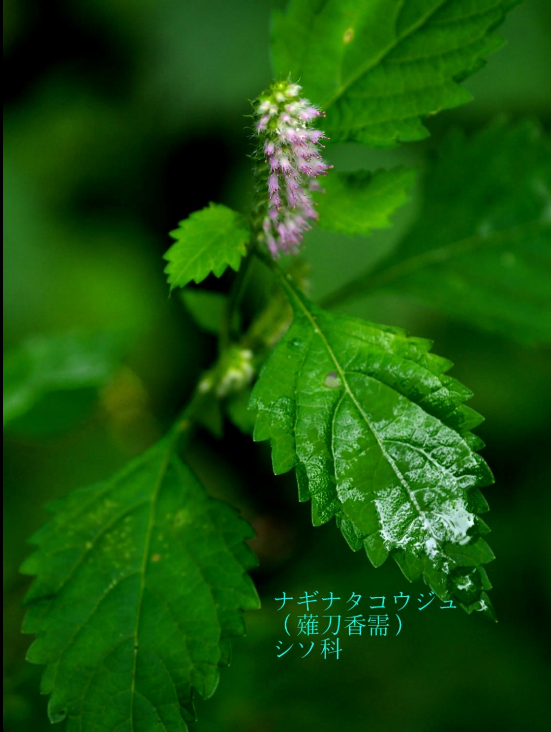
ナギナタコウジュ (薙刀香需) シソ科