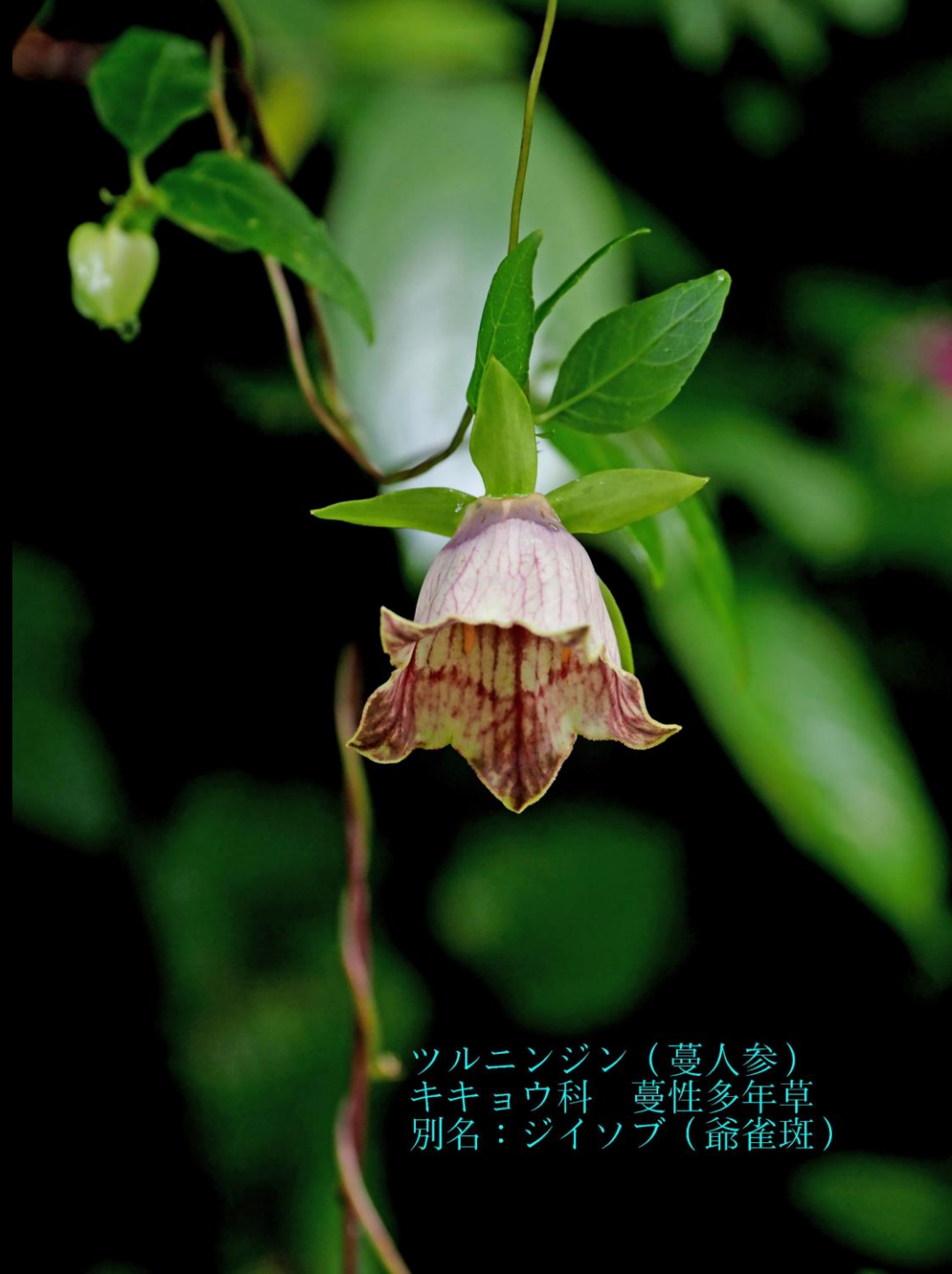
ツルニンジン (蔓人参) キキョウ科 蔓性多年草 別名：ジイソブ (爺雀斑)