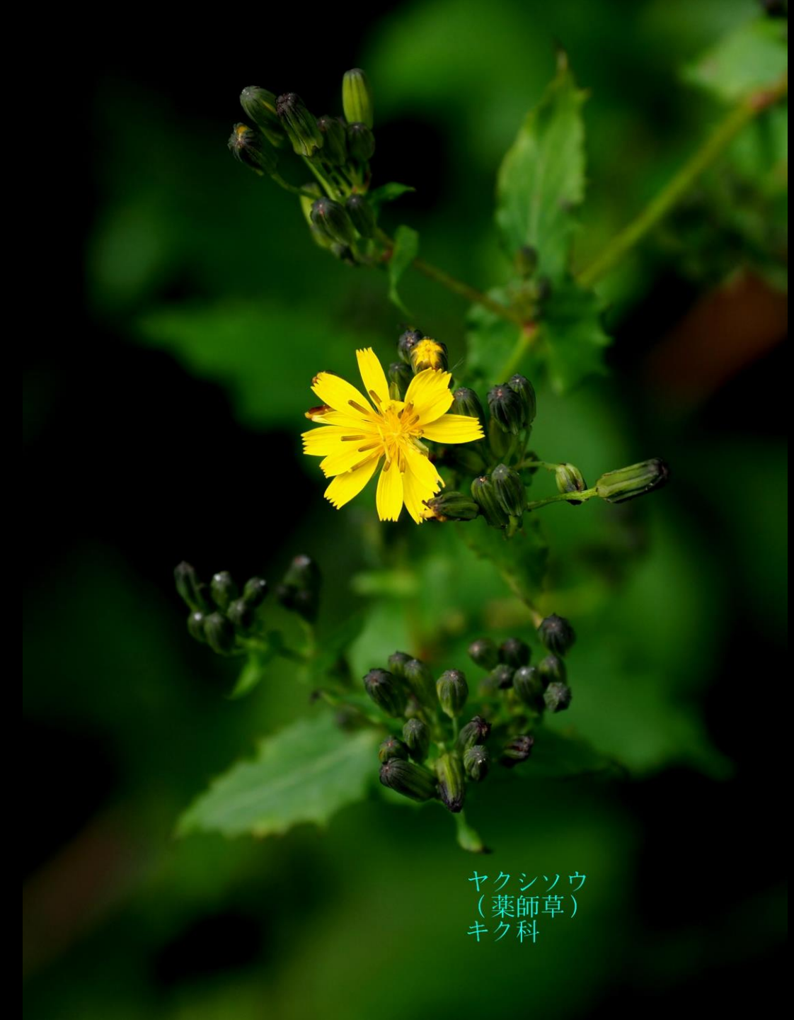
ヤクシソウ (薬師草) キク科