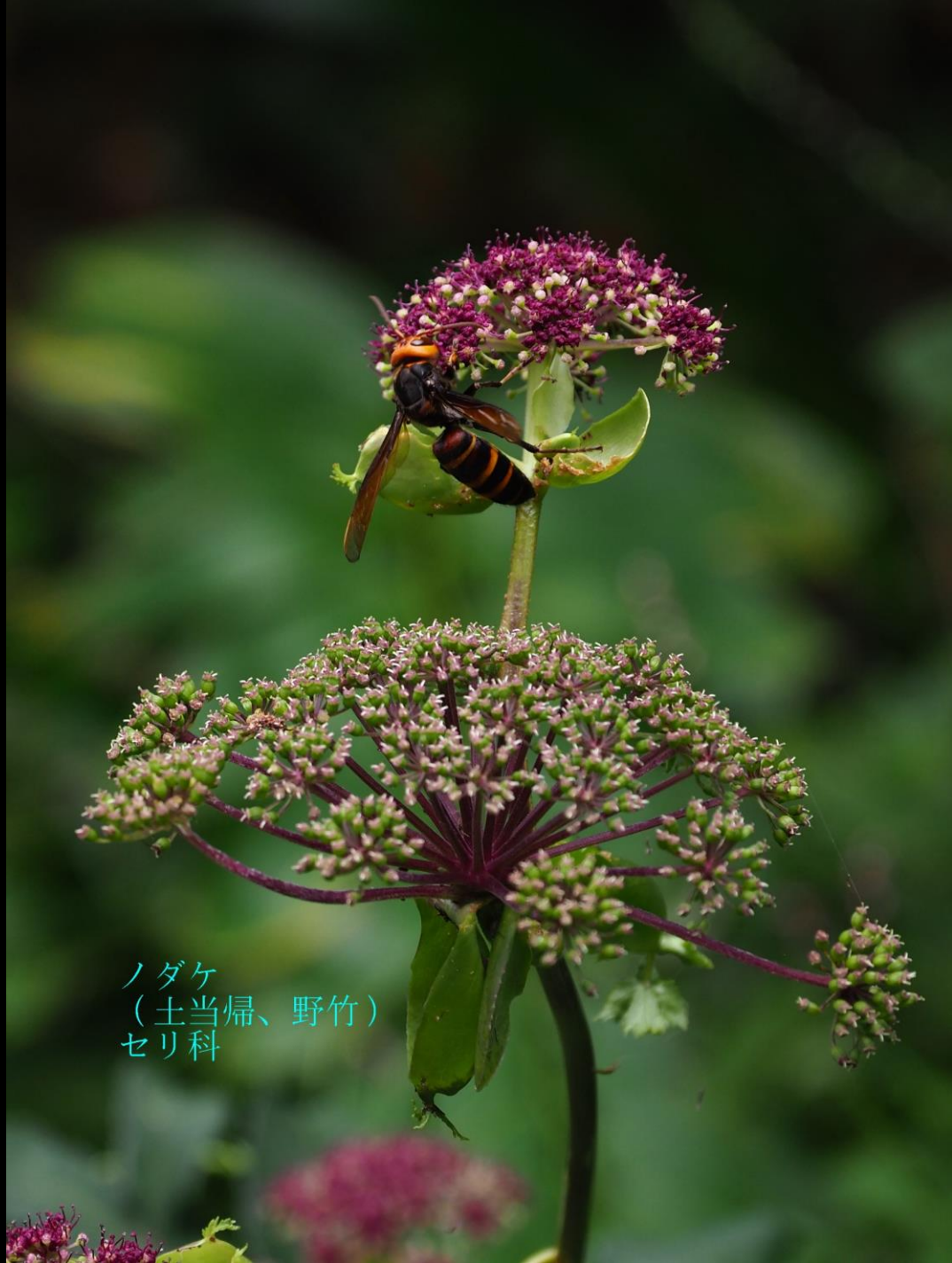
ノダケ (土当归、野竹) セリ科