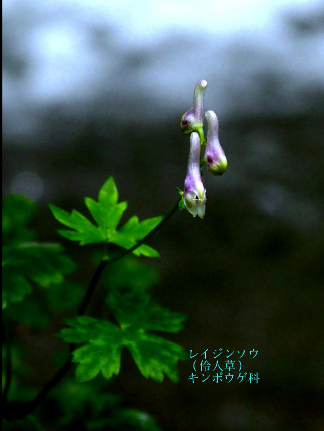
レイジンソウ (伶人草) キンポウゲ科