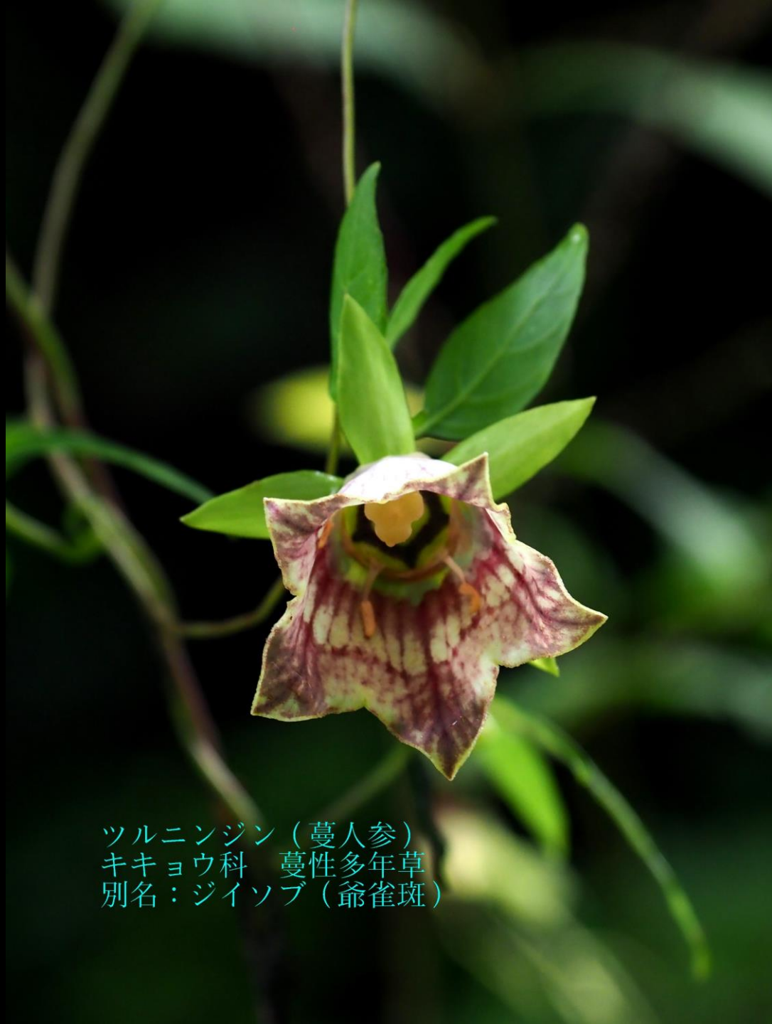
ツルニンジン（蔓人参） キキョウ科 蔓性多年草 別名：ジイソブ（爺雀斑）