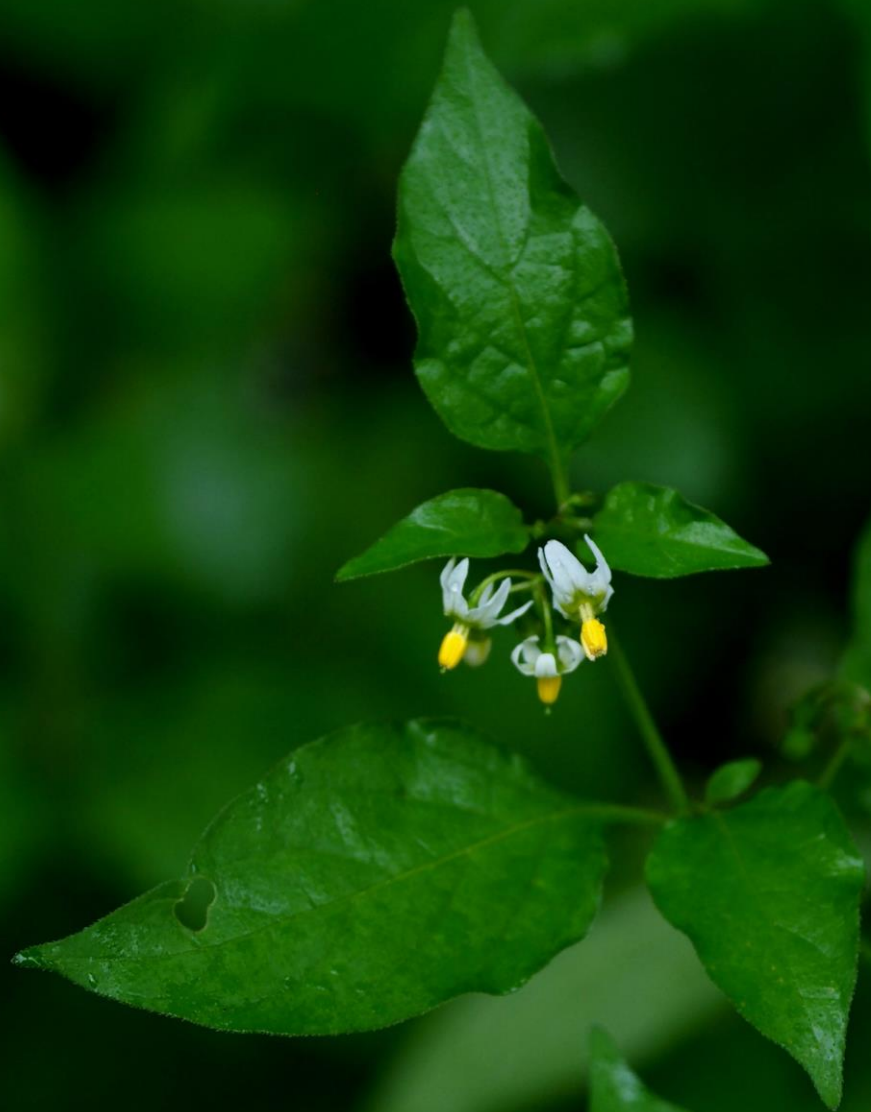
イヌホオズキ (犬酸漿) ナス科