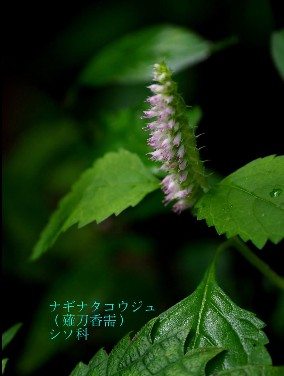
ナギナタコウジュ (薙刀香需) シソ科