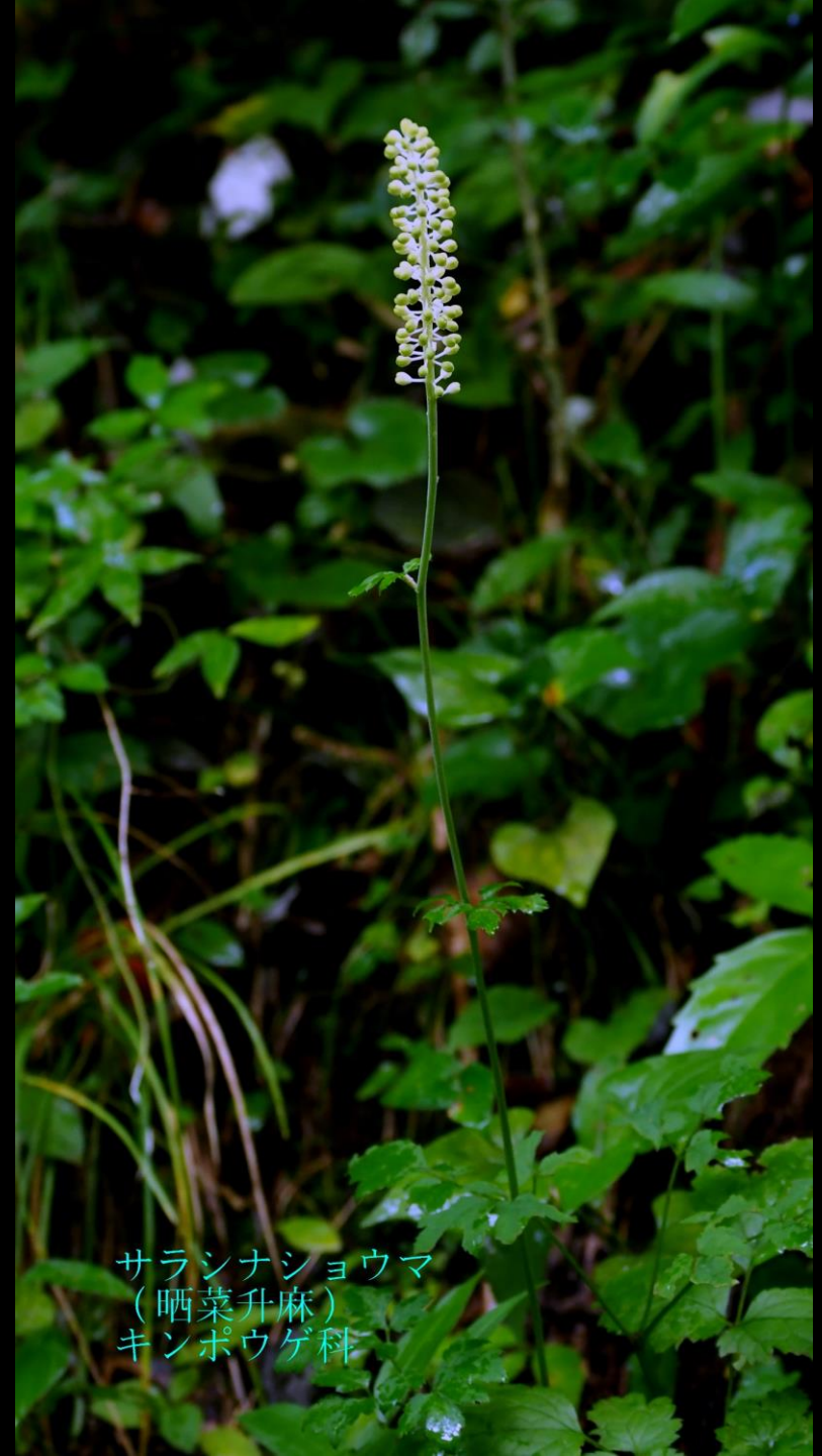
サラシナショウマ (晒菜升麻) キンポウゲ科