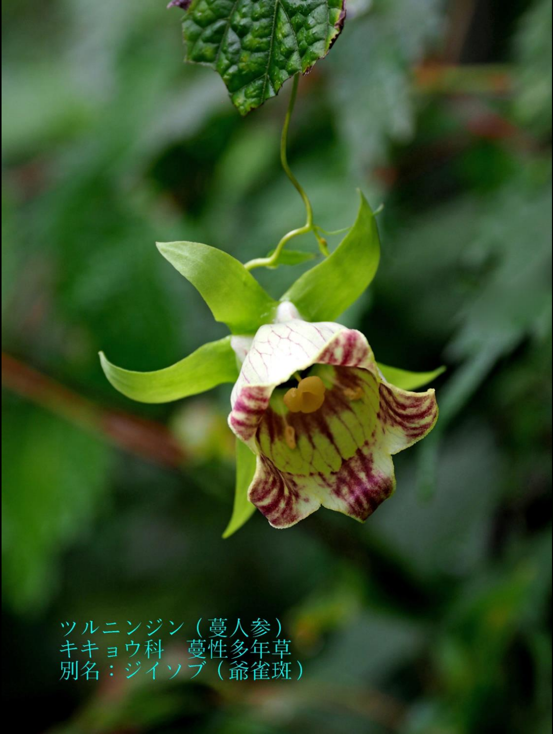
ツルニンジン（蔓人参） キキョウ科 蔓性多年草 別名：ジイソブ（爺雀斑）