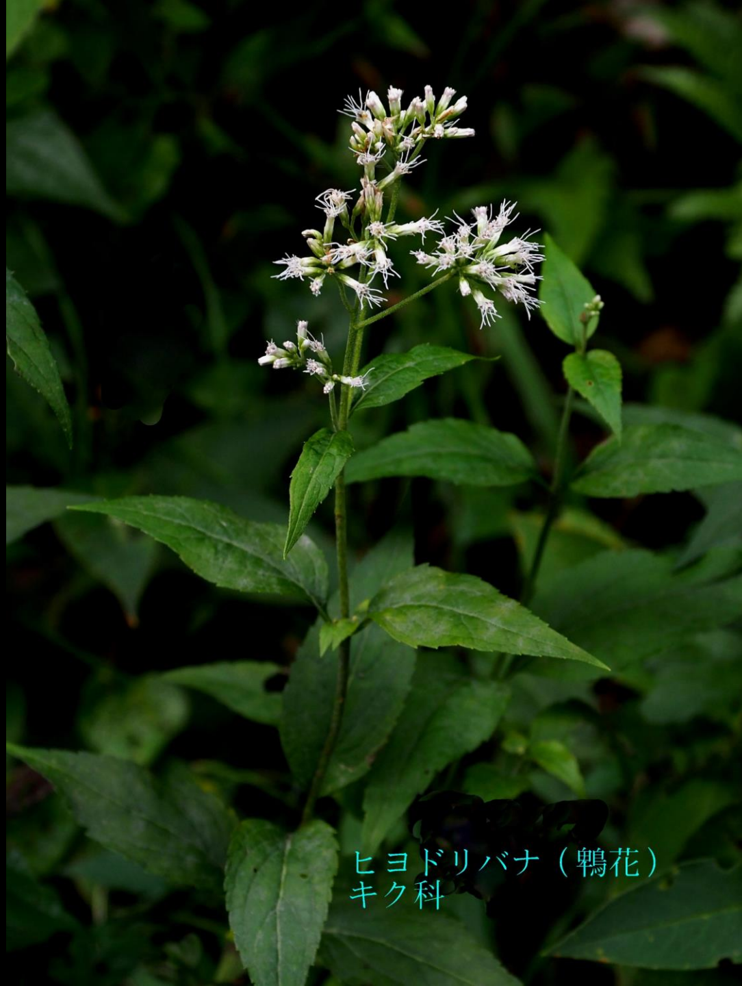
ヒヨドリバナ（鶉花） キク科