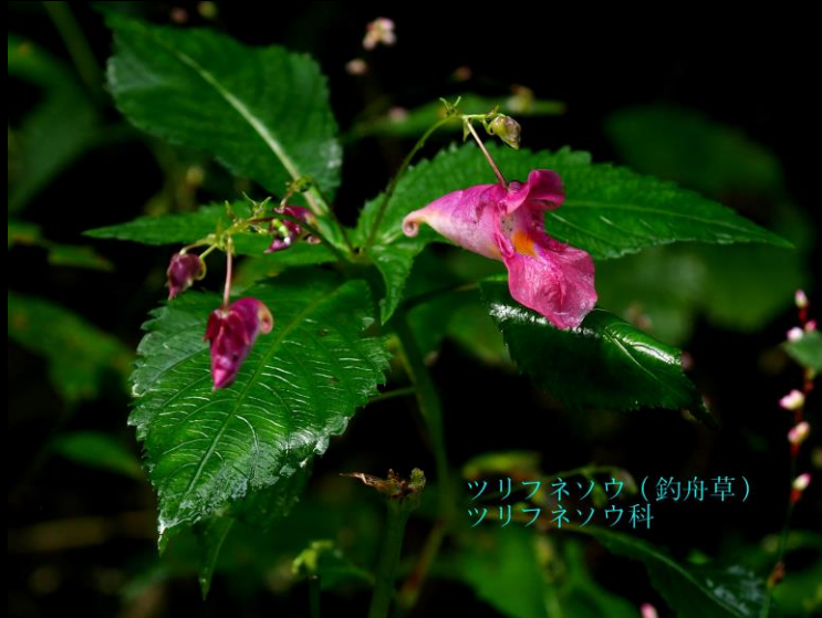
ツリフネソウ (釣舟草) ツリフネソウ科