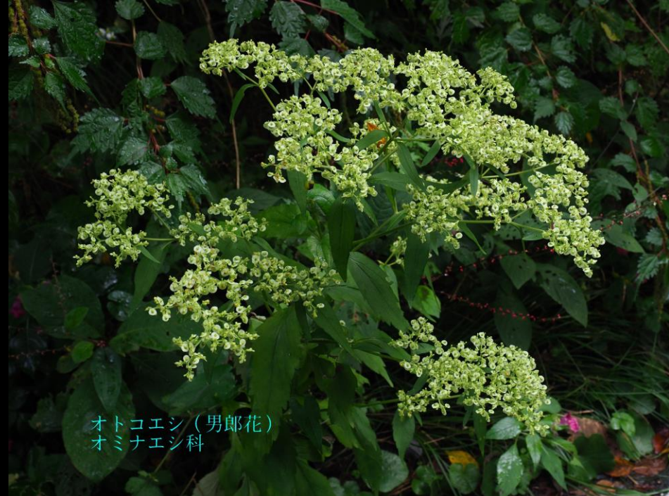
オトコエシ (男郎花) オミナエシ科