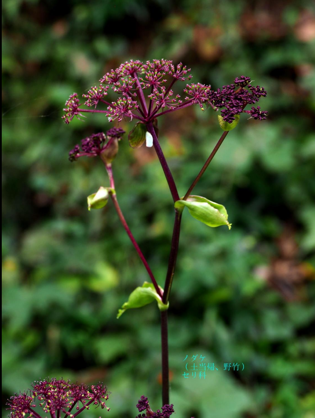
ノダケ (土当归、野竹) セリ科