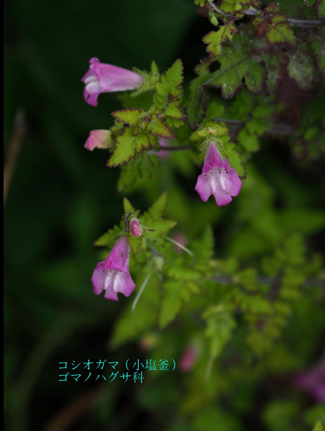
コシオガマ (小塩釜) ゴマノハグサ科