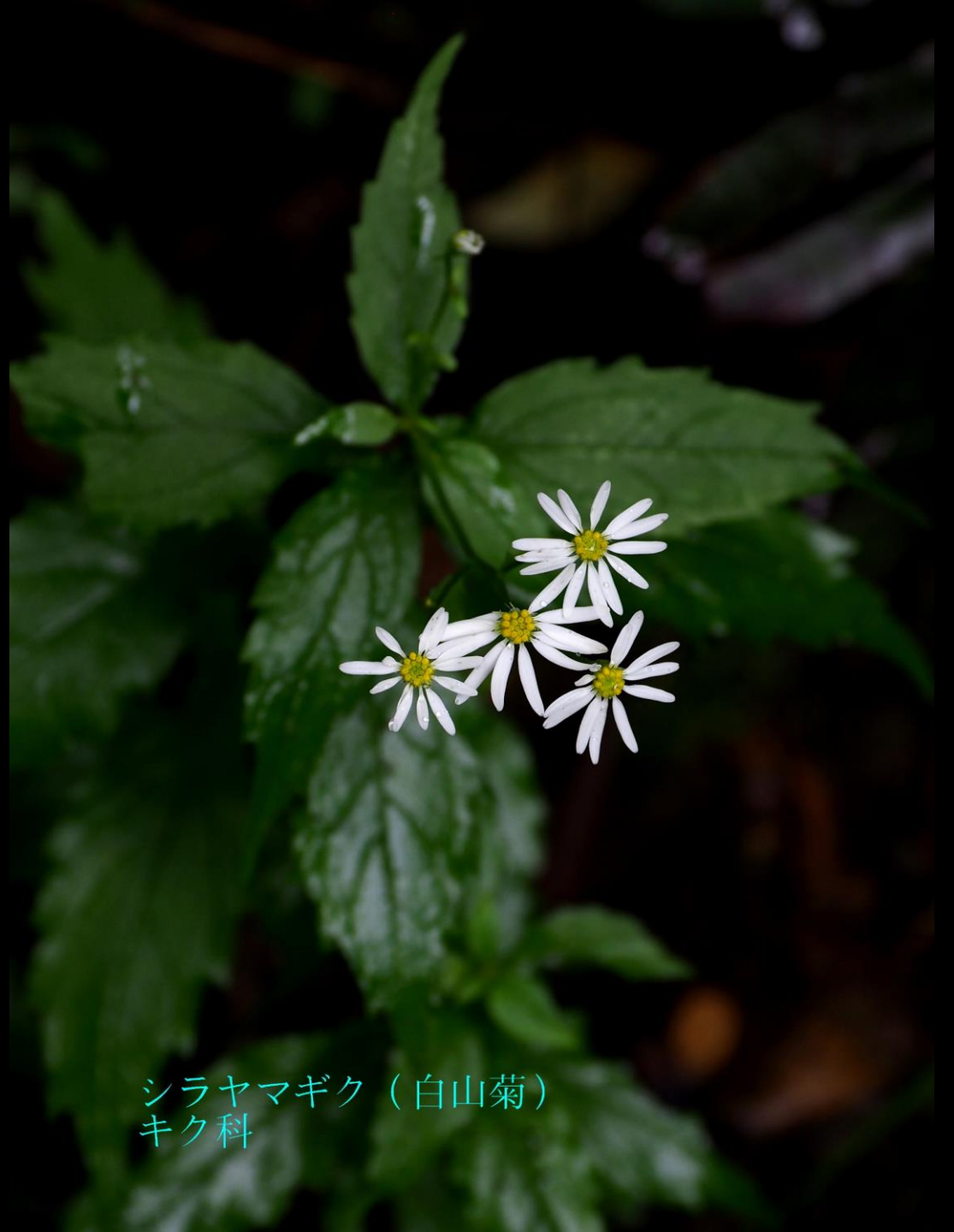
シラヤマギク（白山菊） キク科