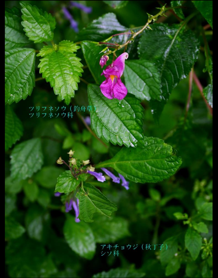
ツリフネソウ (釣舟草) ツリフネソウ科