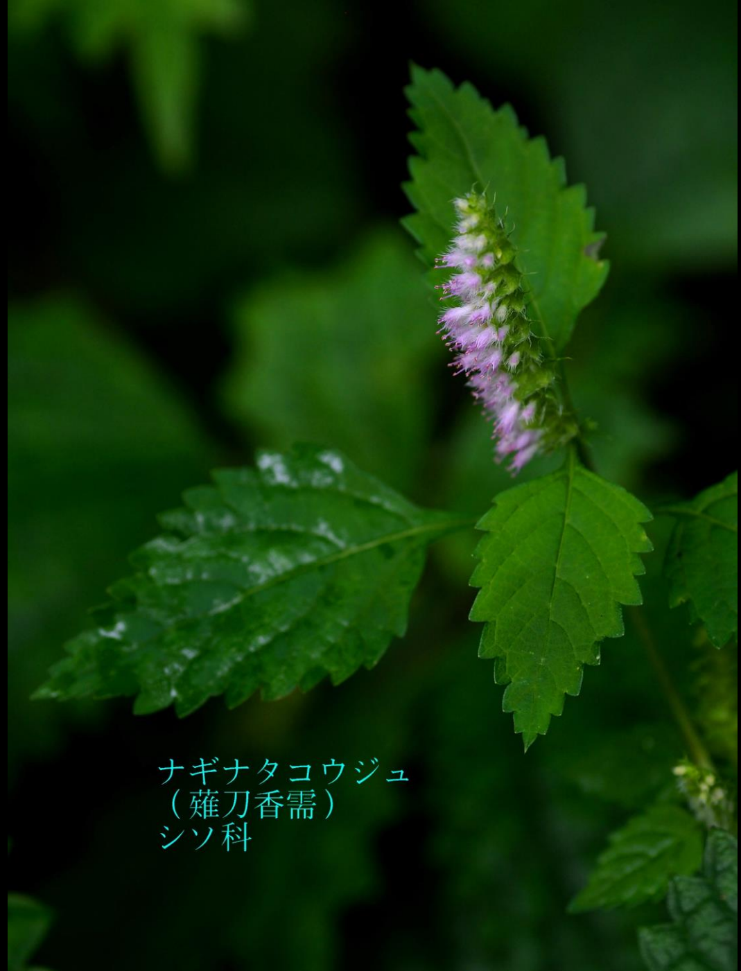
ナギナタコウジュ (薙刀香薷) シソ科