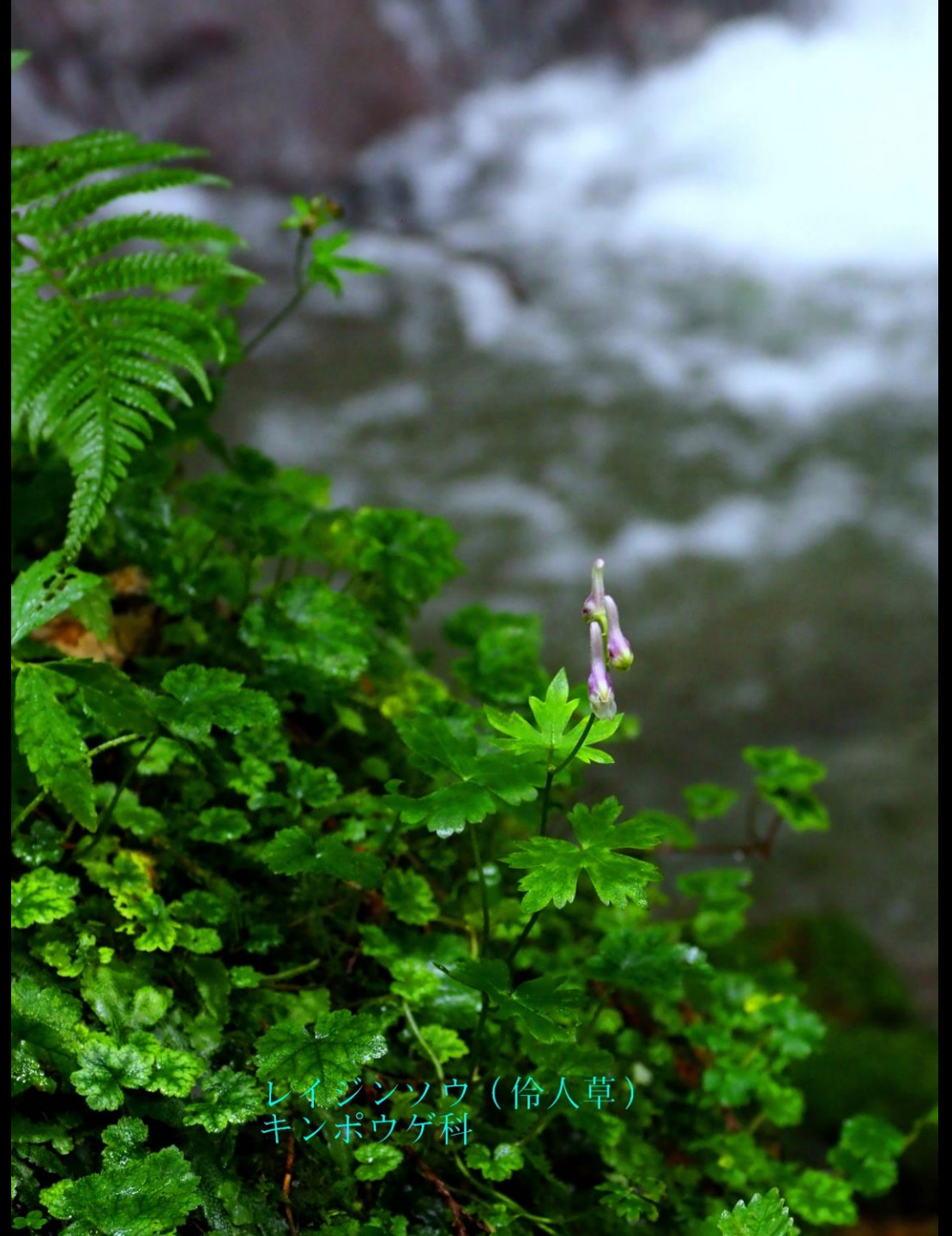
レイジンソウ (伶人草) キンポウゲ科