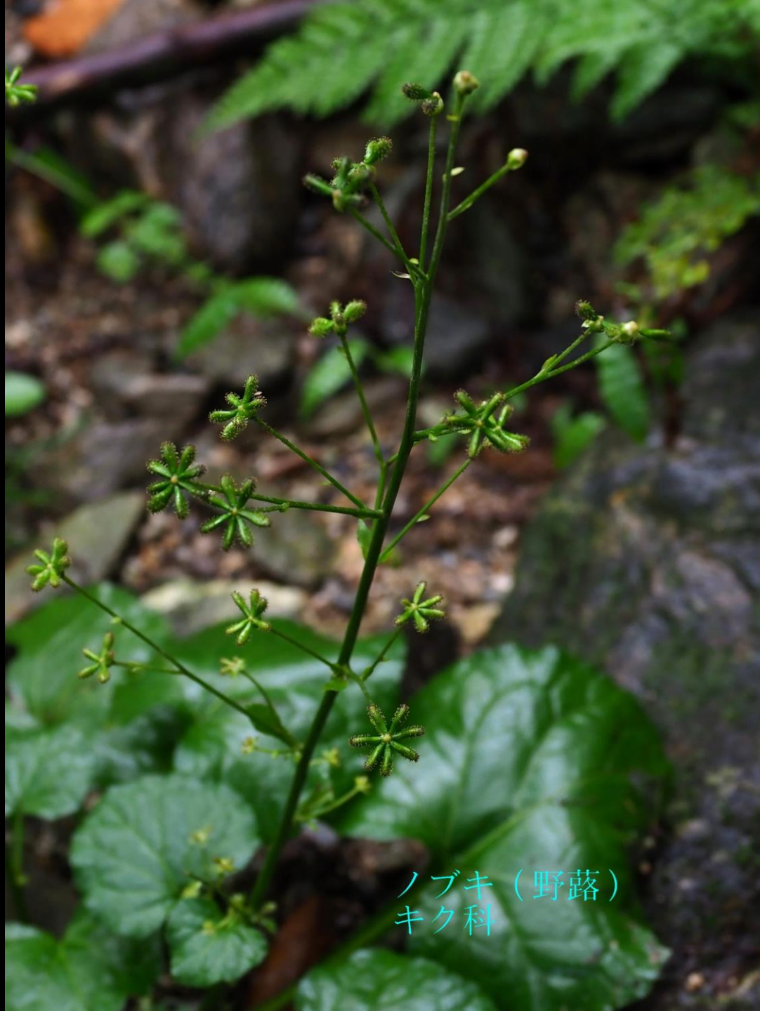
ノブキ (野蔭) キク科