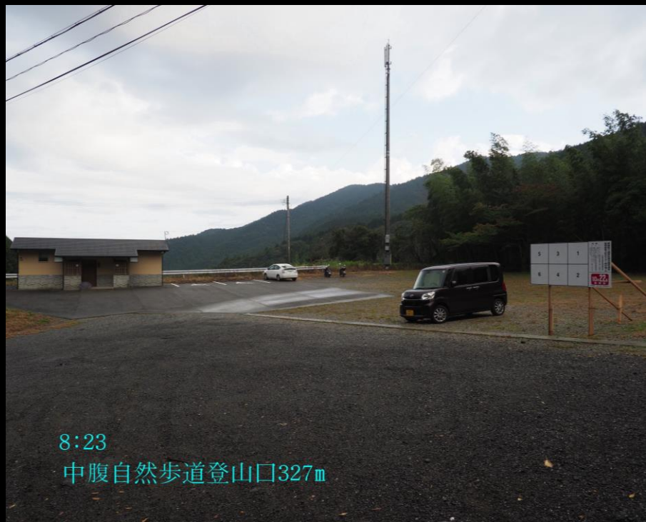
8:23 中腹自然歩道登山口327m