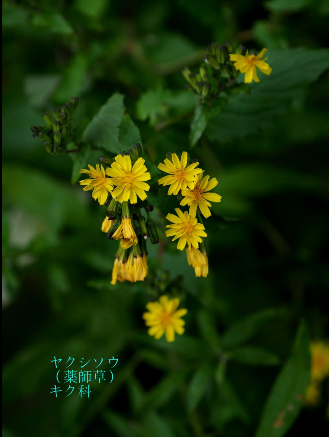
ヤクシソウ (薬師草) キク科