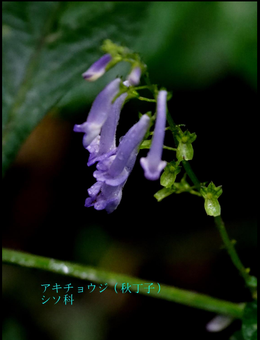
アキチョウジ（秋丁子） シソ科