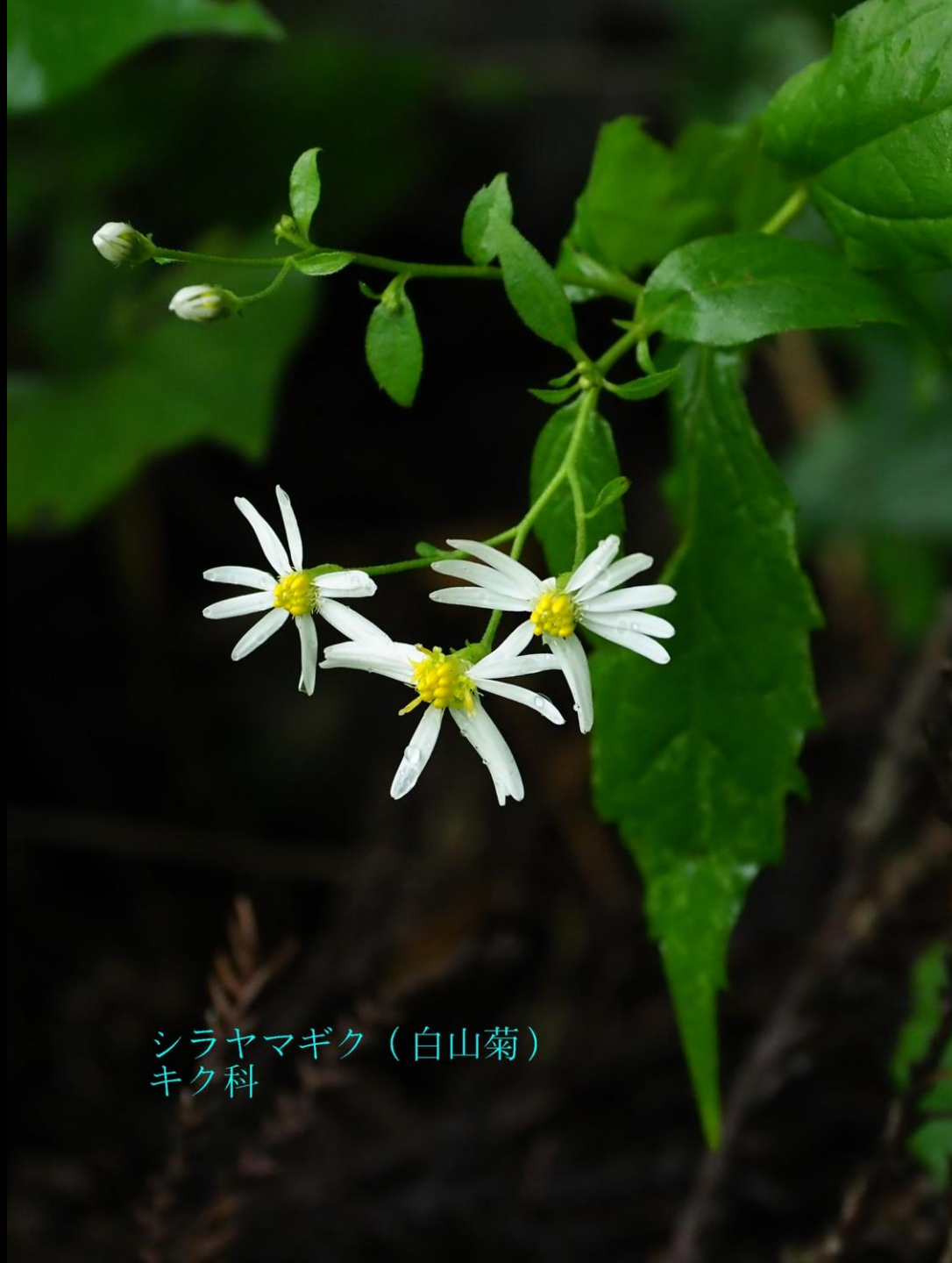
シラヤマギク（白山菊） キク科