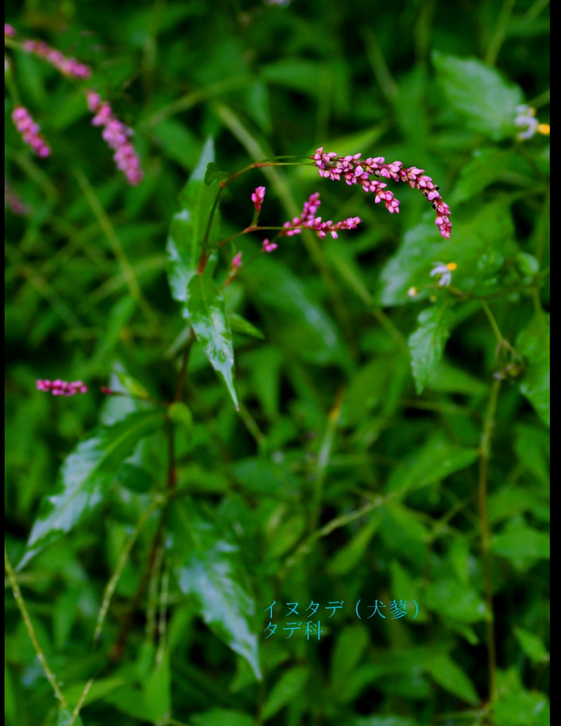
イヌタデ（犬蓼） タデ科