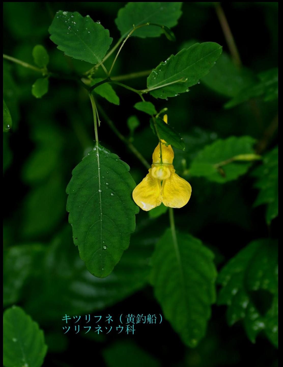
キツリフネ (黄釣船) ツリフネソウ科