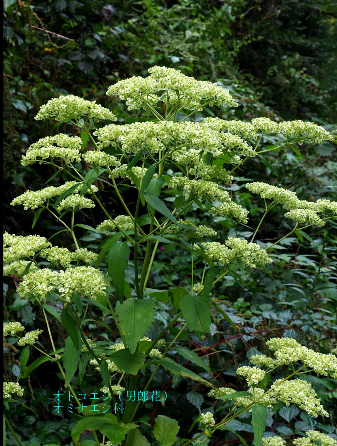
オトコエシ (男郎花) オミナエシ科