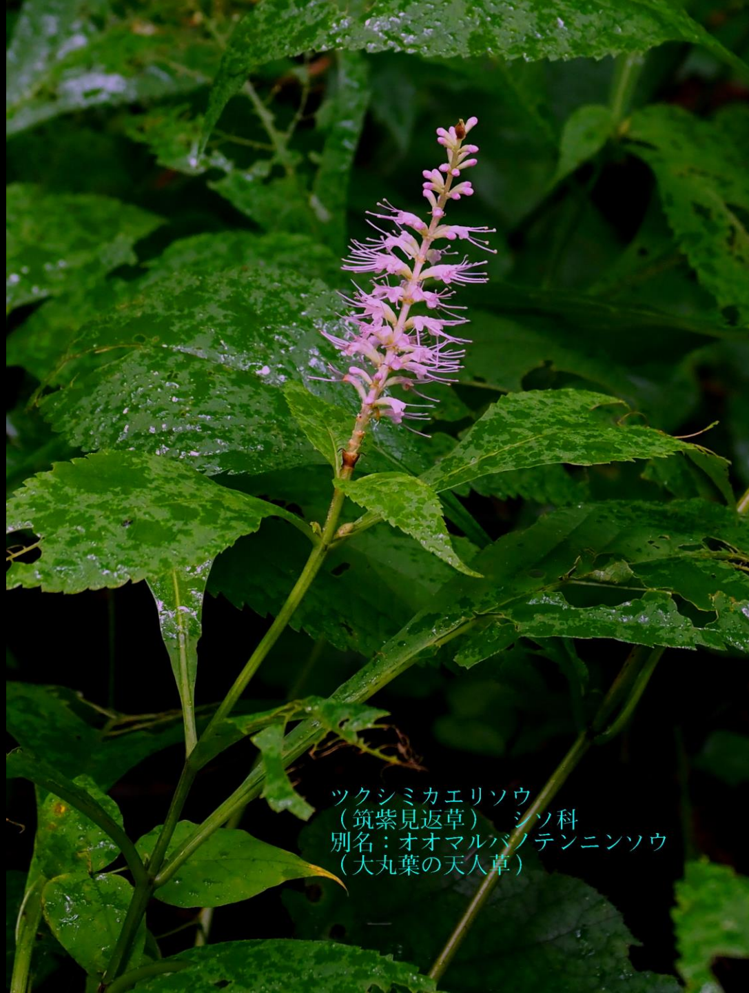
ツクシミカエリソウ (筑紫見返草) シソ科 別名：オオマルバノテンニンソウ (大丸葉の天人草)