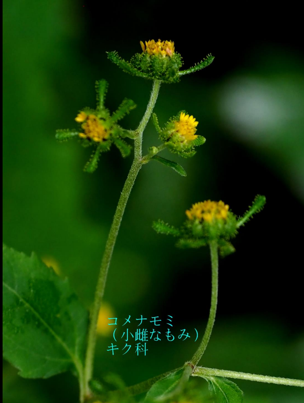
コメナモミ (小雌なもみ) キク科