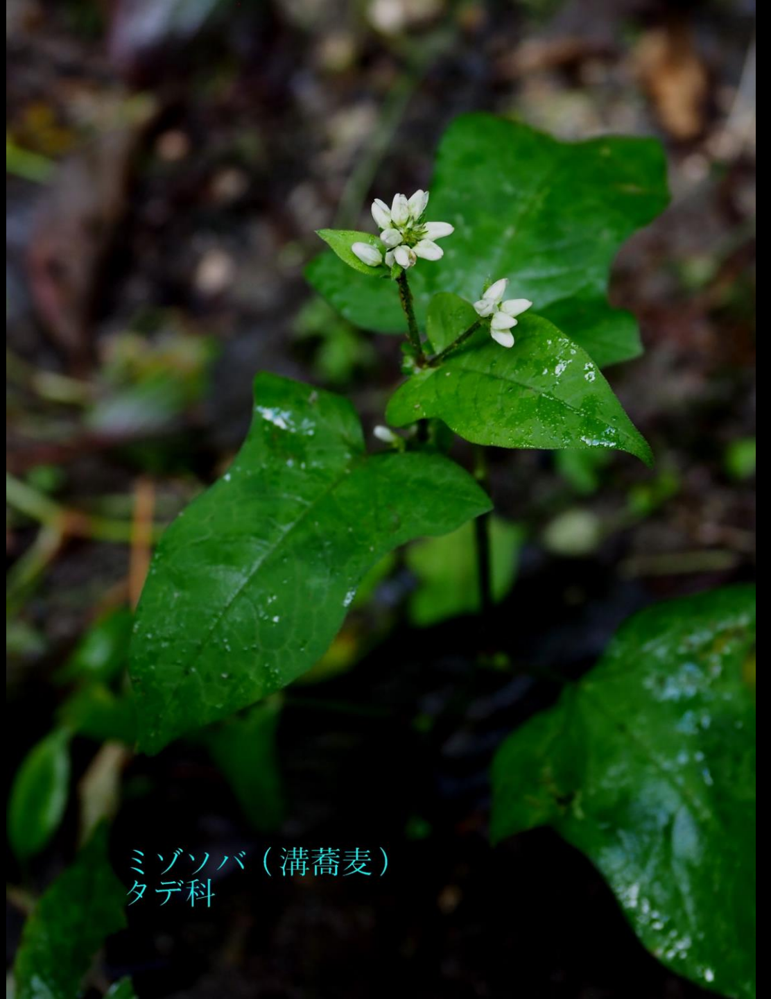
ミゾソバ（溝蕎麦） タデ科