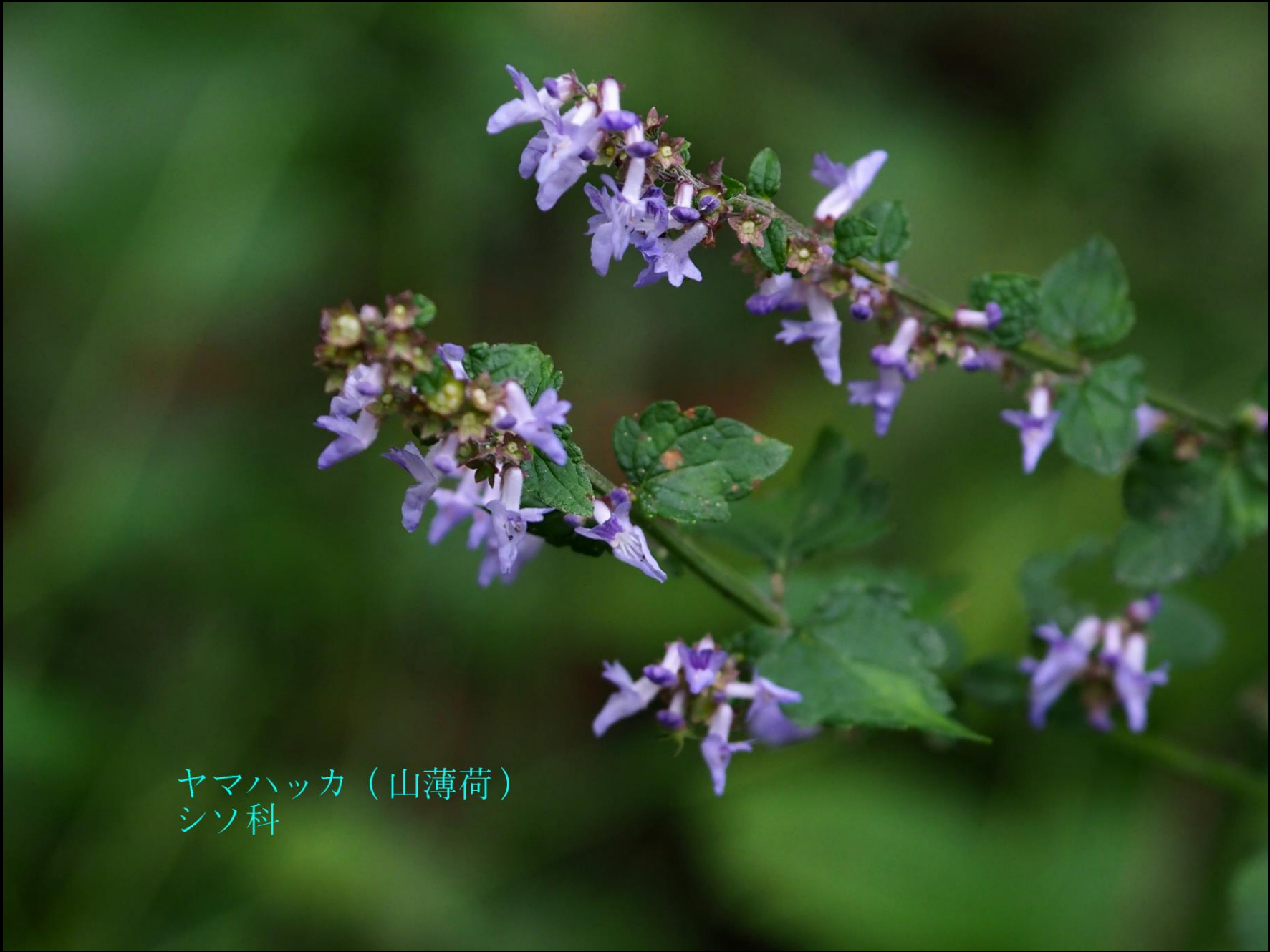
ヤマハッカ (山薄荷) シソ科