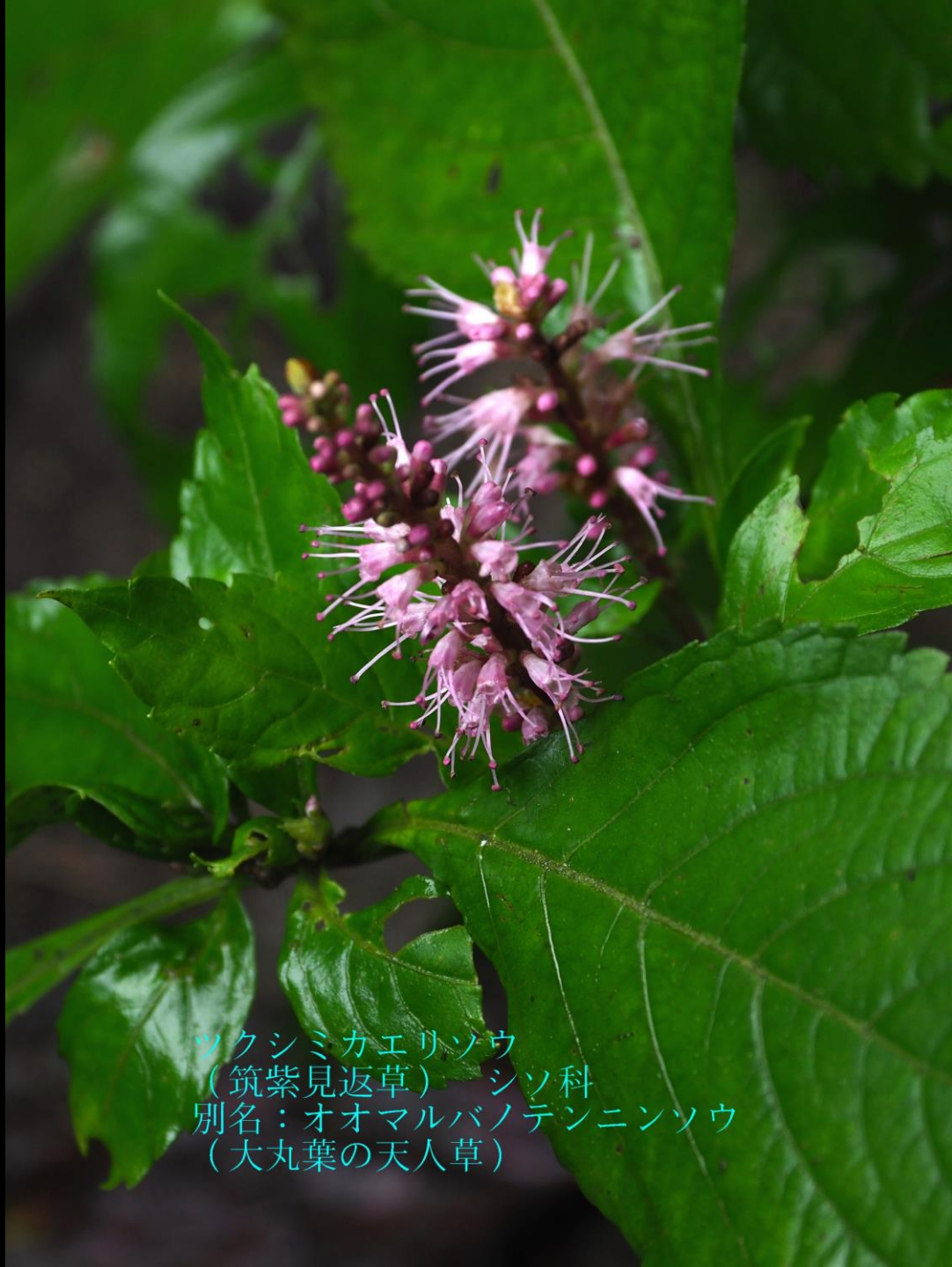
ツクシミガエリソウ (筑紫見返草) シソ科 別名：オオマルバノテンニンソウ (大丸葉の天人草)