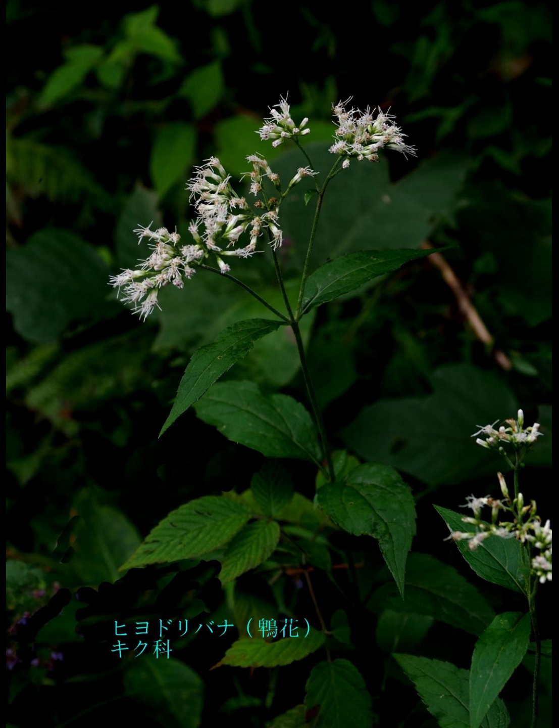
ヒヨドリバナ（鶉花） キク科