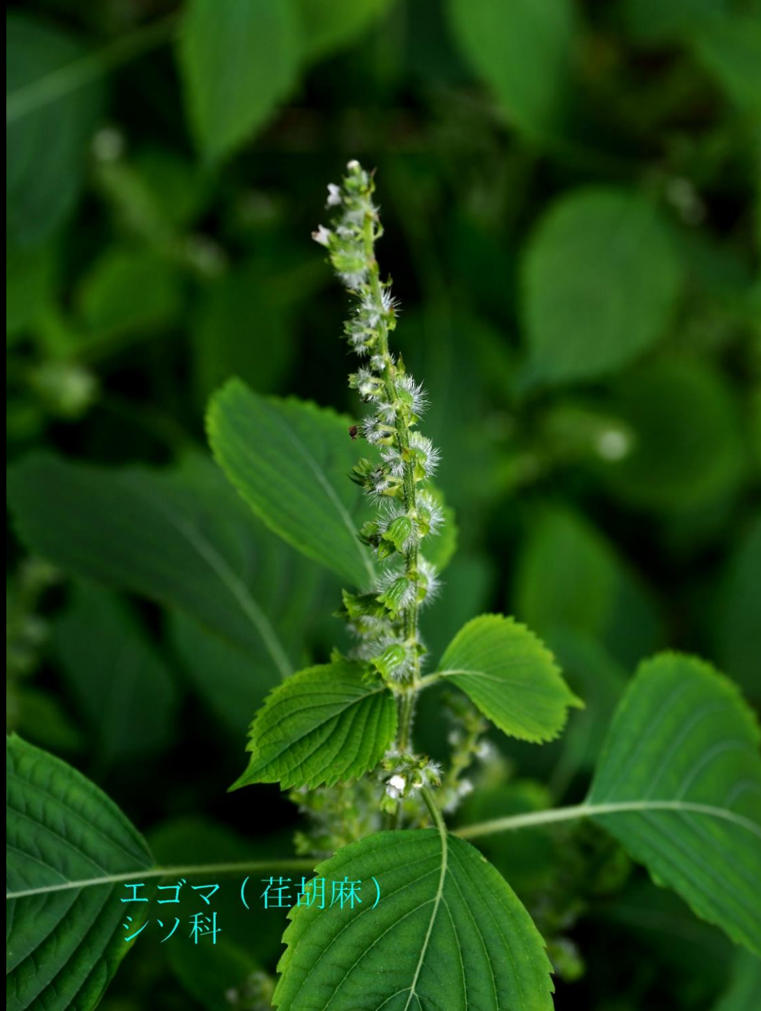
エゴマ (荏胡麻) シソ科