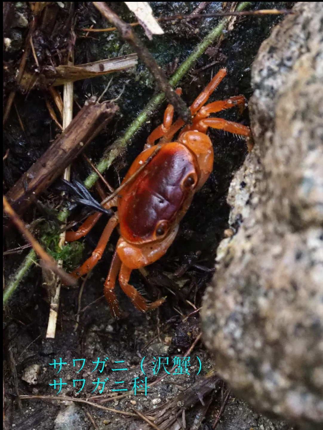
サワガニ（沢蟹） サワガニ科