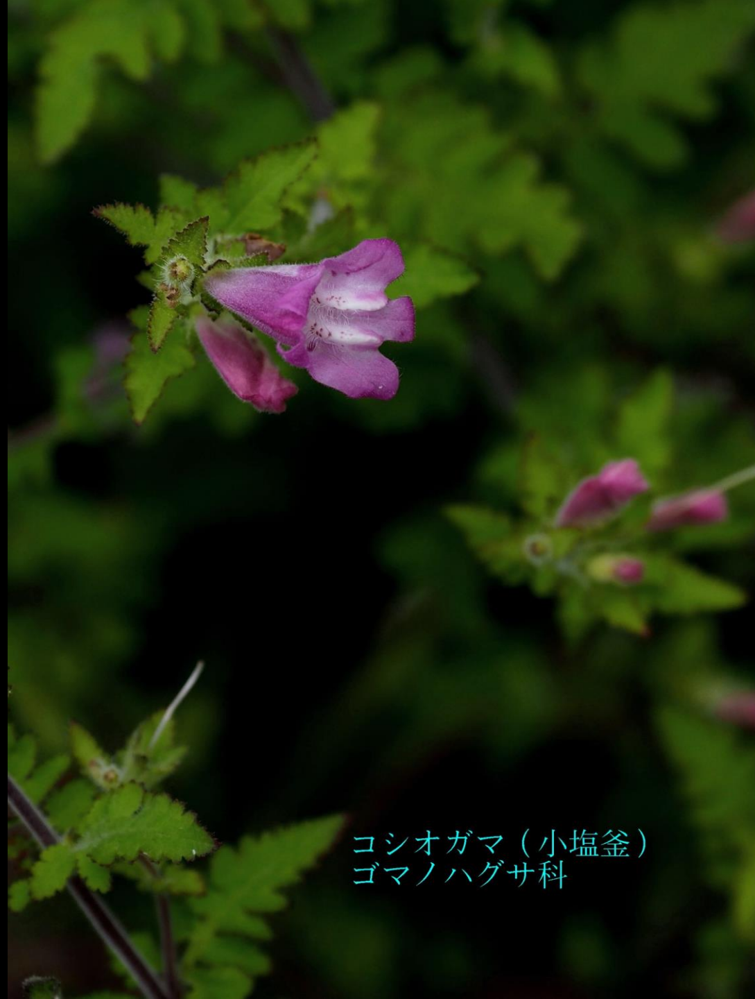
コシオガマ (小塩釜) ゴマノハグサ科