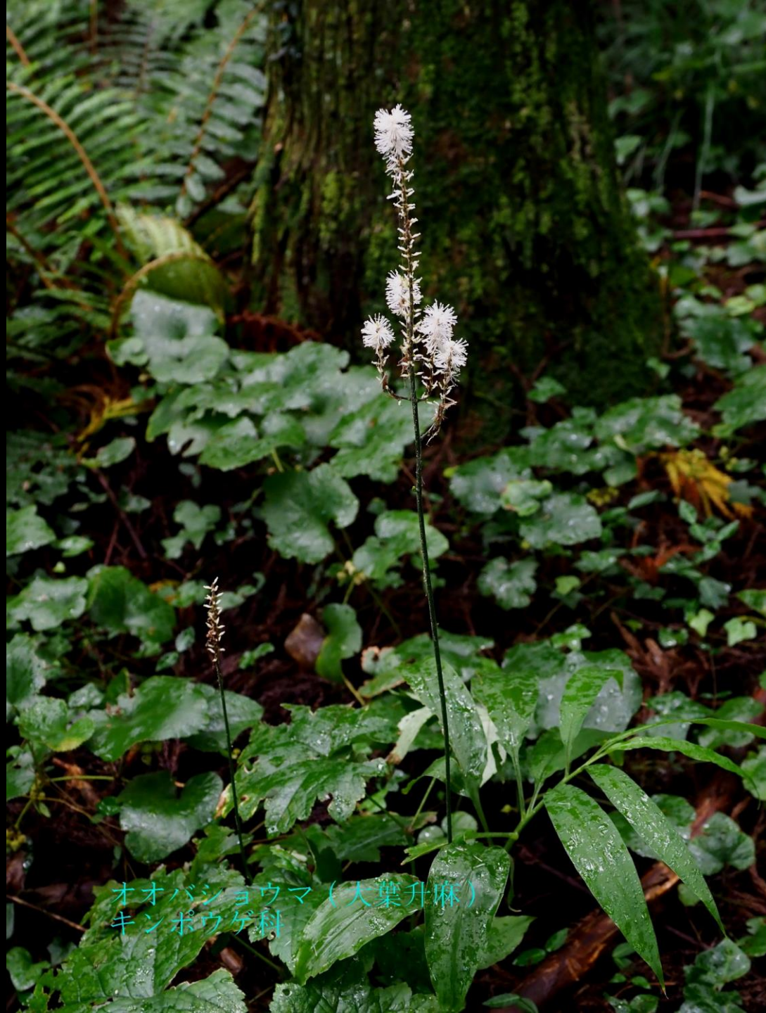
オオバショウマ (大葉升麻) キンボウゲ科