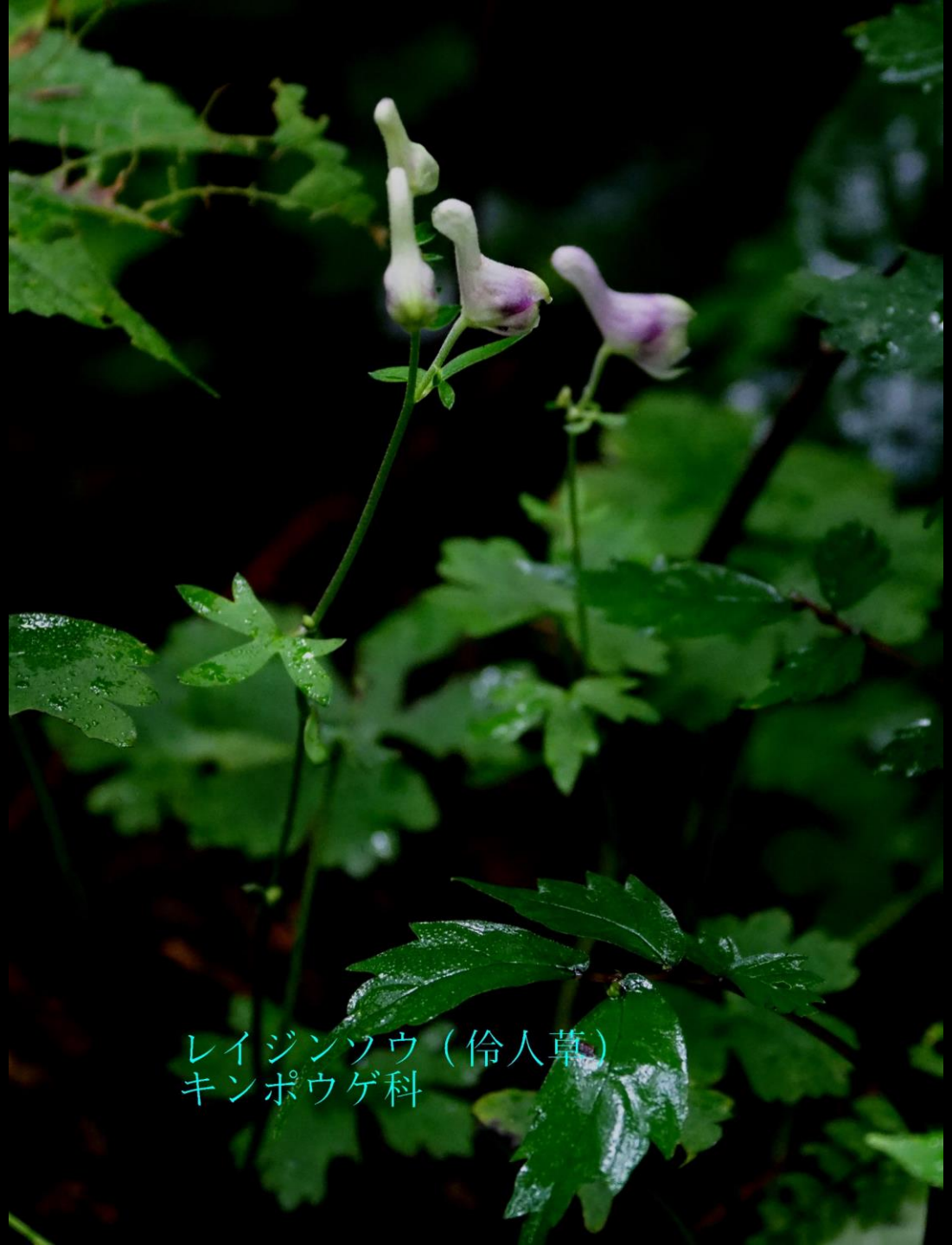
レイジンソウ (伶人草) キンポウゲ科