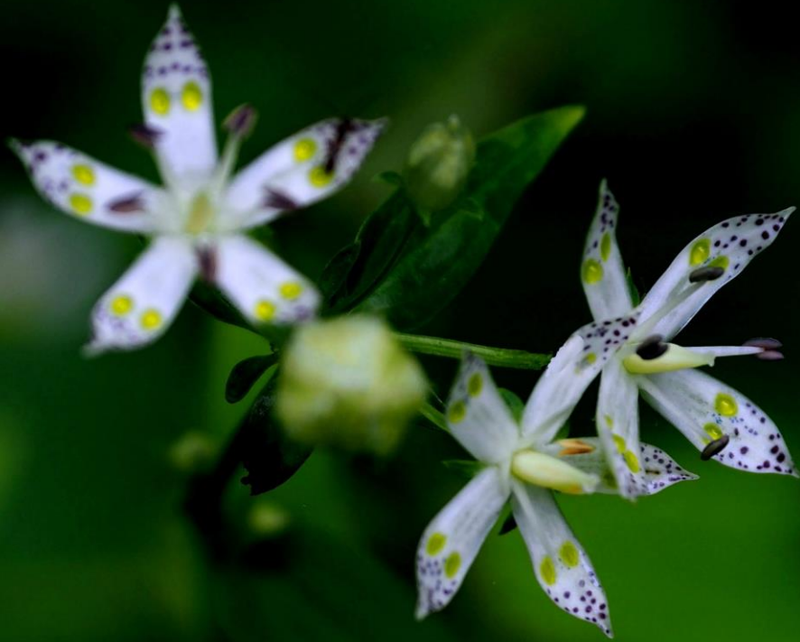
アケボノソウ（曙草） リンドウ科