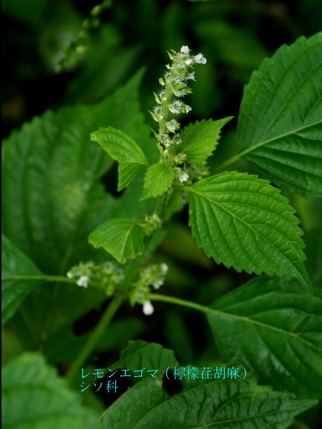
レモンエゴマ（檸檬荳胡麻） シソ科