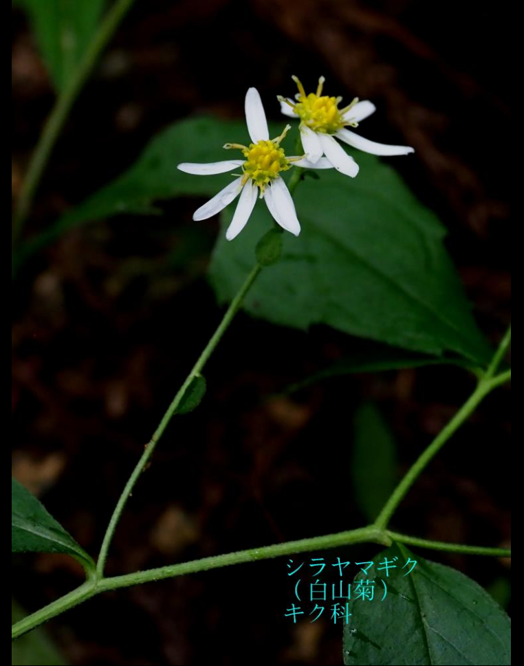
シラヤマギク (白山菊) キク科