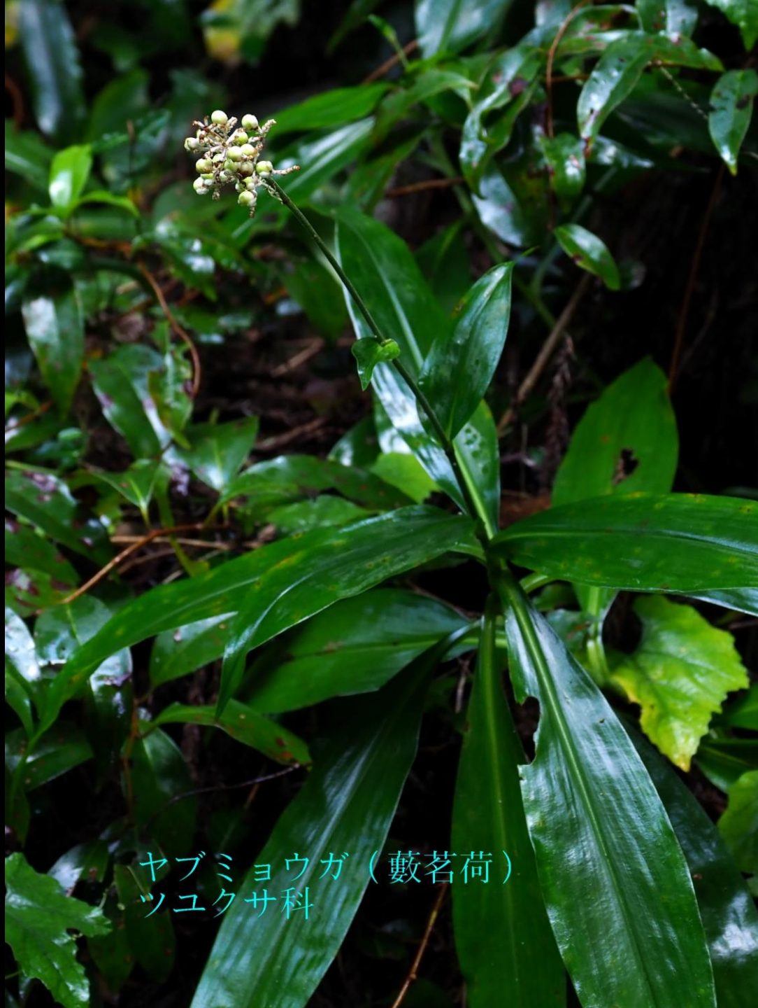
ヤブミョウガ（藪茗荷） ツユクサ科