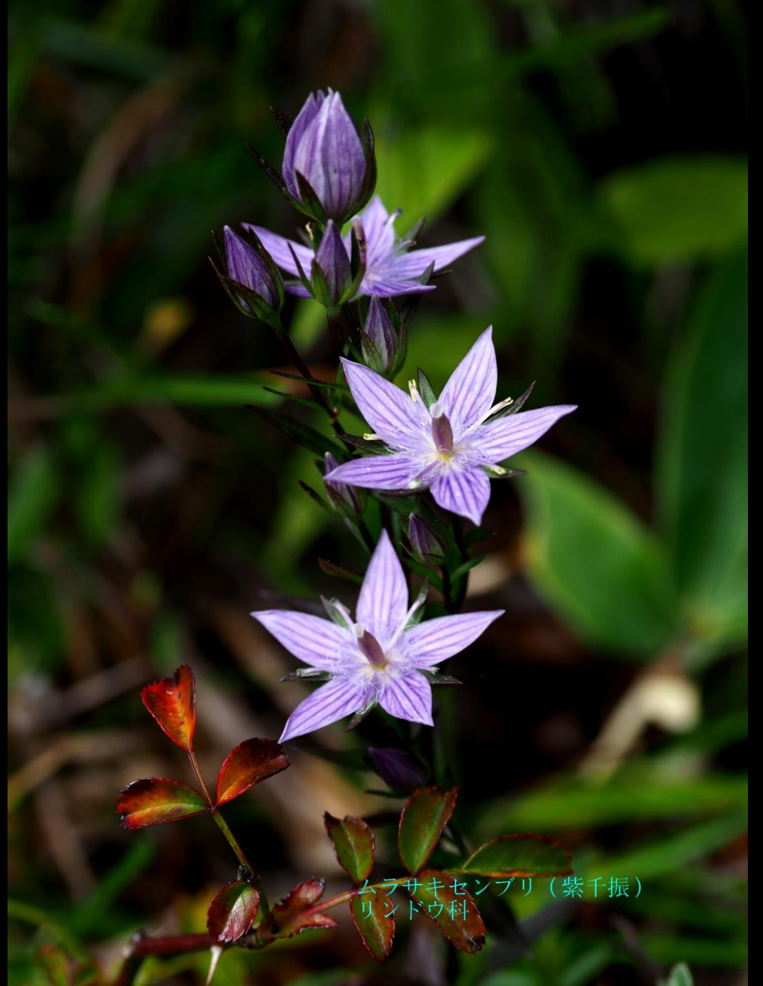
ムラサキセンブリ（紫千振） リンドウ科