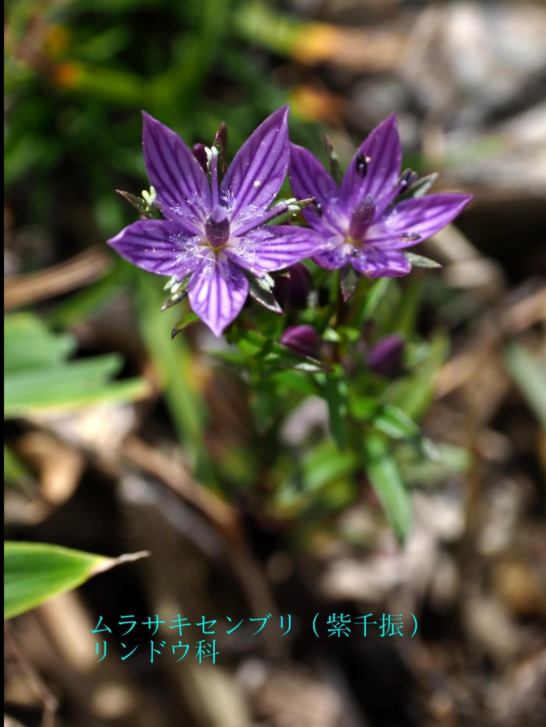
ムラサキセンブリ（紫千振） リンドウ科