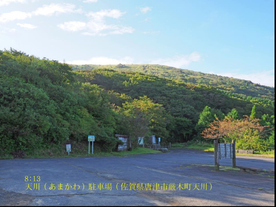
8:13 天川（あまかわ）駐車場（佐賀県唐津市厳木町天川）