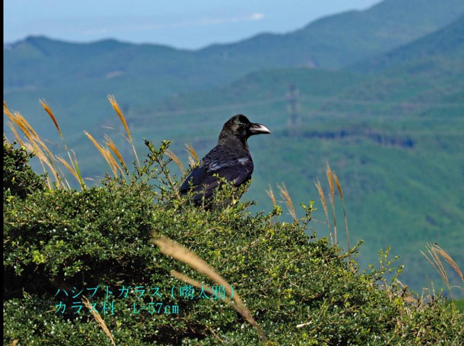
ハシブトガラス (嘴太鴉) カラス科 L=57cm