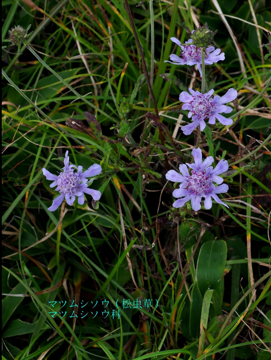
マツムシソウ（松虫草） マツムシソウ科