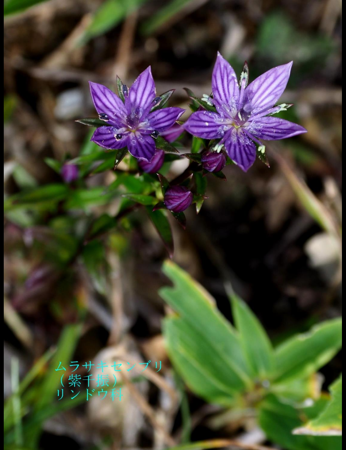
ムラサキセンブリ （紫千振） リンドウ科