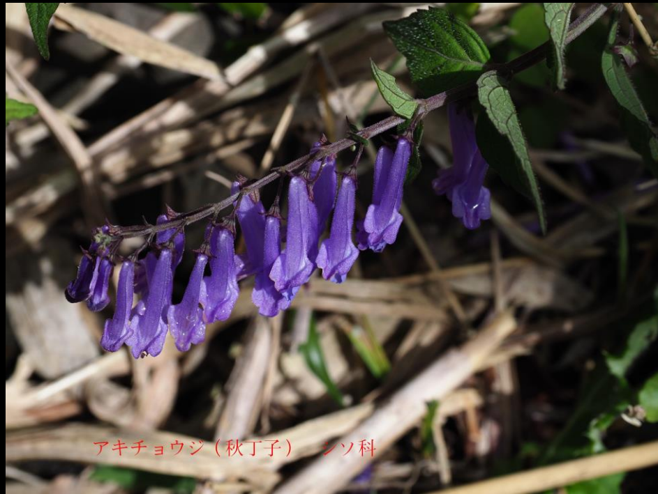
アキチョウジ (秋丁子) キク科