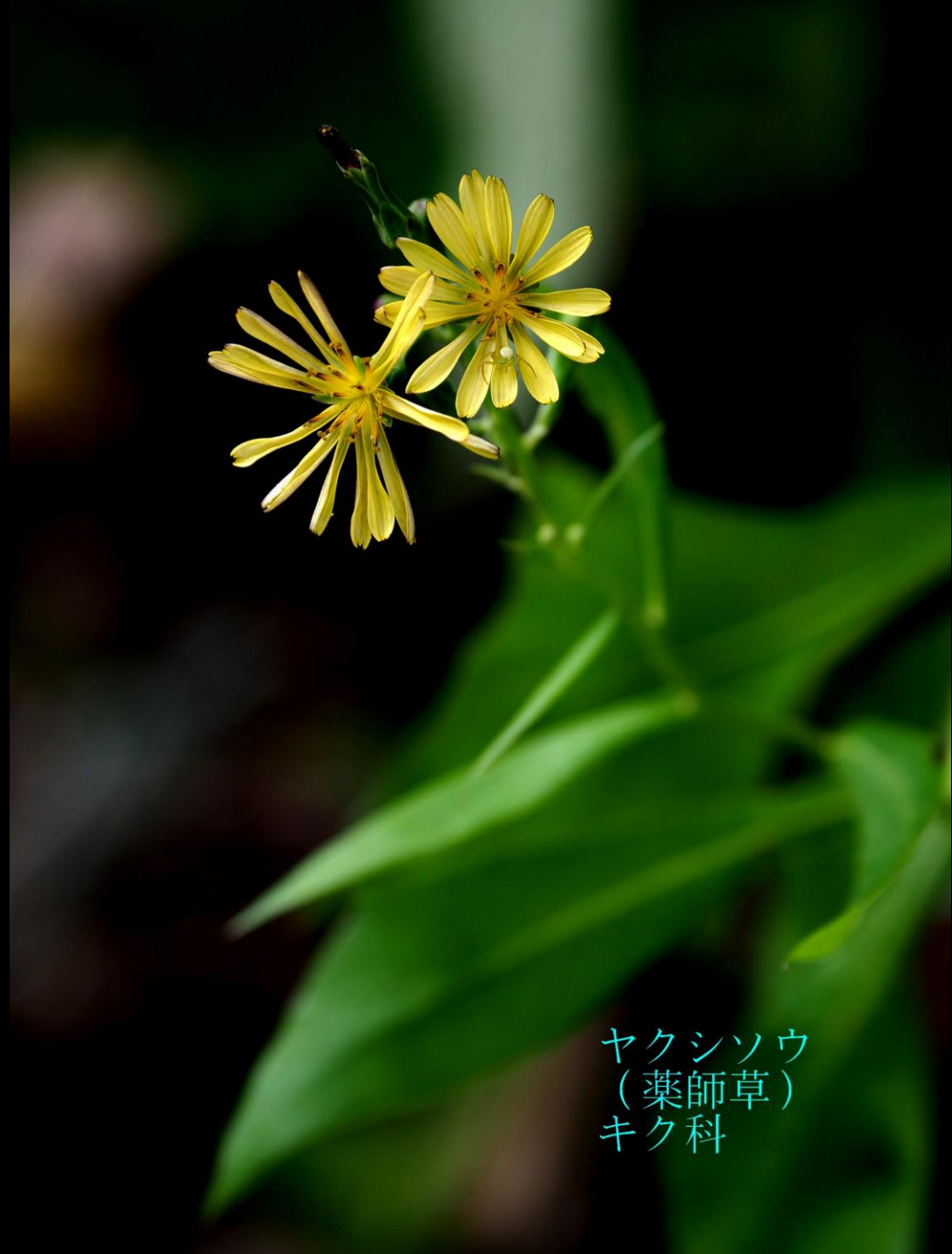
ヤクシソウ （薬師草） キク科