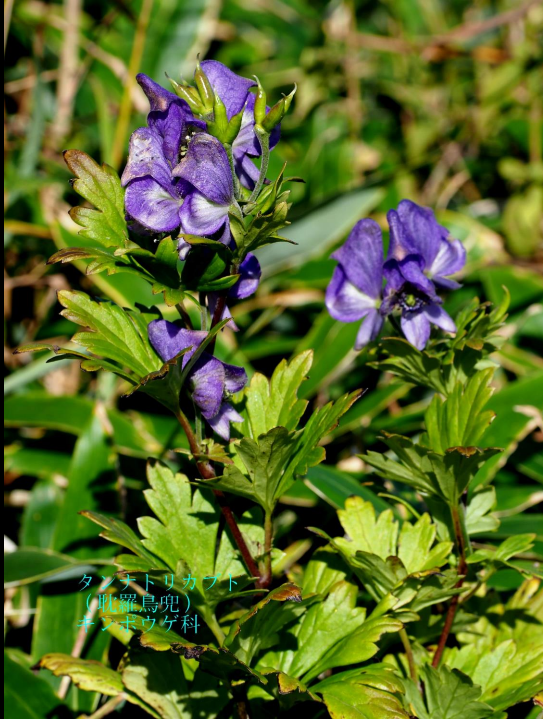
タンナトリカブト (耽羅烏兜) キンポウゲ科