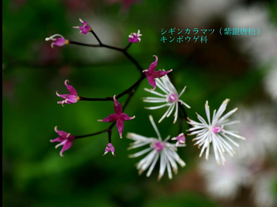
シギンカラマツ (紫銀唐松) キンポウゲ科