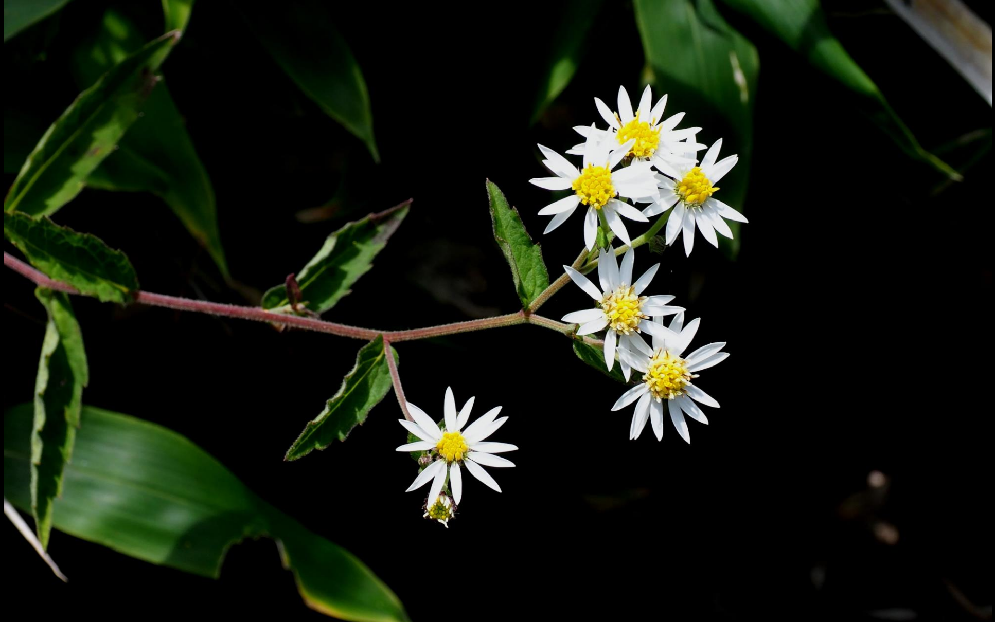
ヤマシロギク (山白菊) キク科 別名：イナカギク (田舎菊)