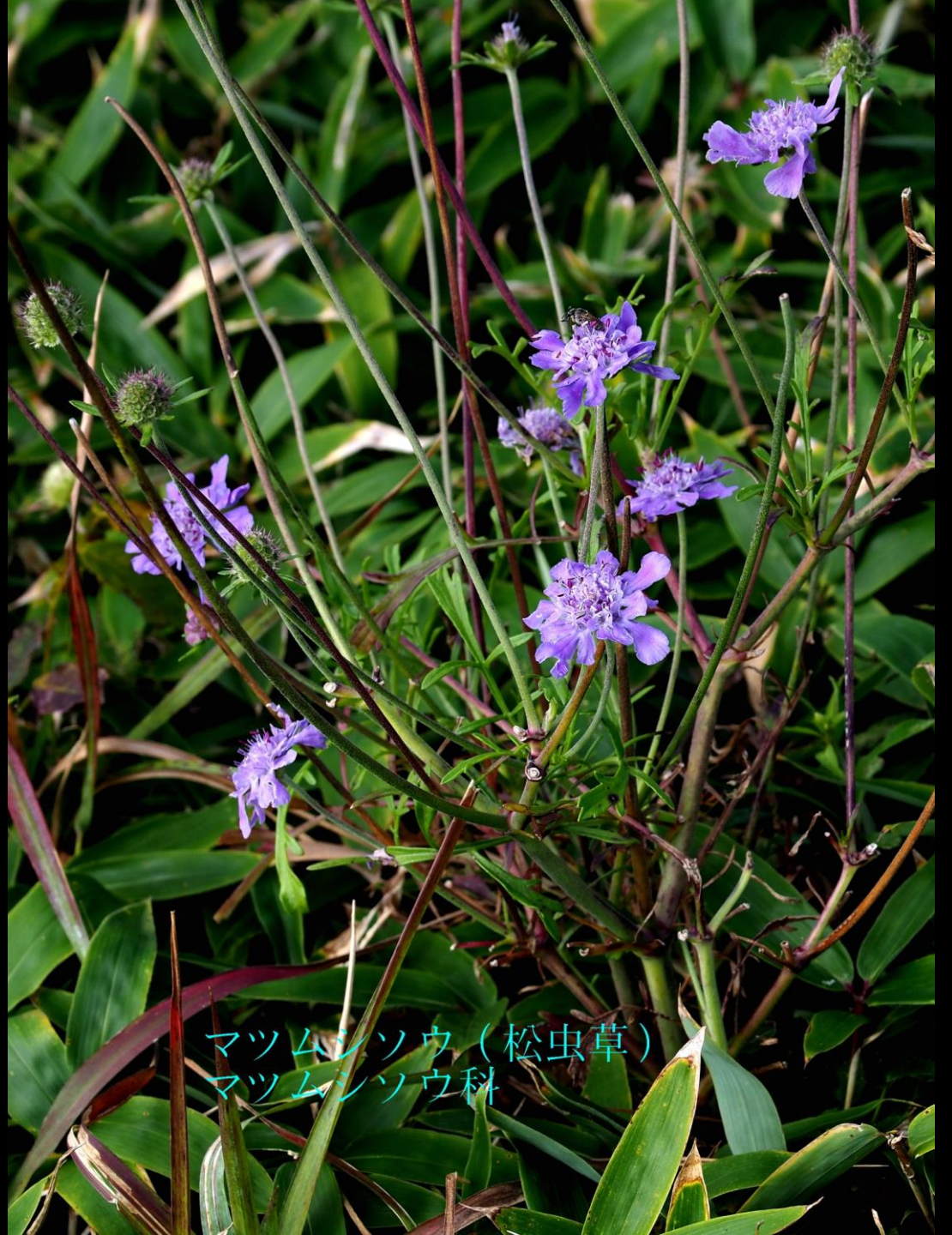
マツムシソウ（松虫草） マツムシソウ科