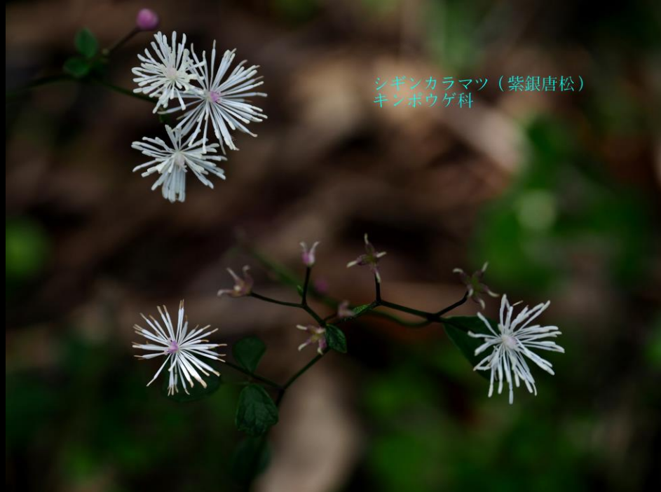
シギンカラマツ (紫銀唐松) キンボウゲ科