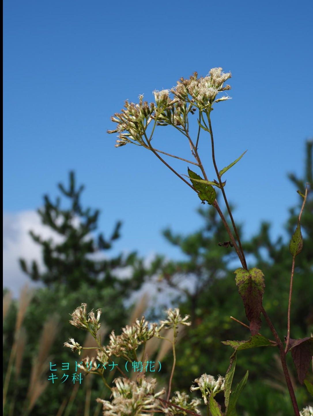
ヒヨドリバナ（鶉花） キク科