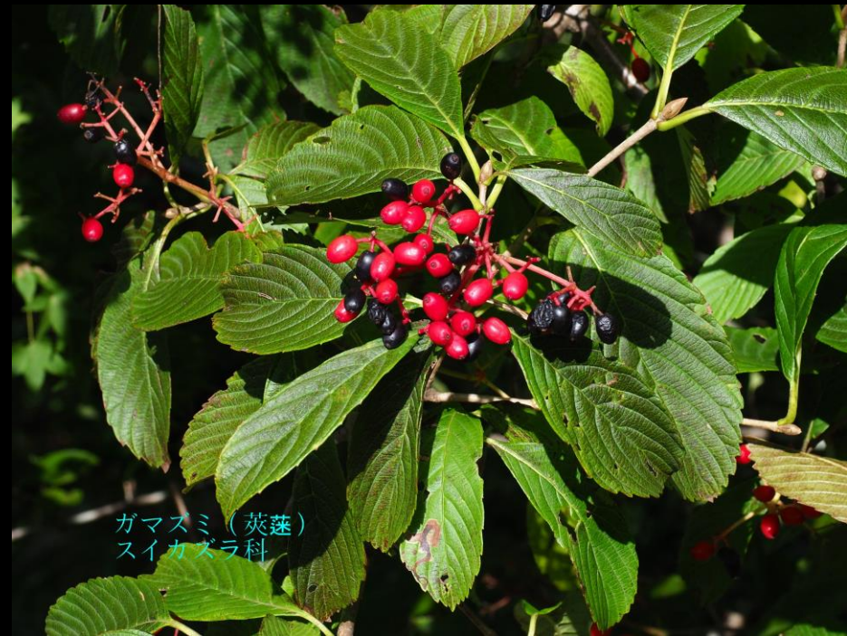
ガマスミ (莢蒾) スイカズラ科