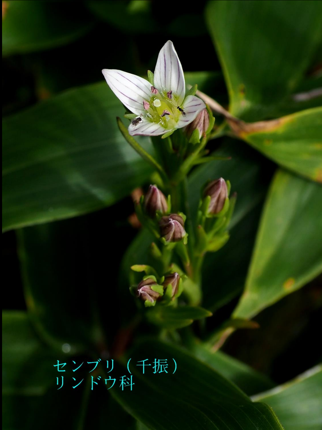
センブリ（千振） リンドウ科