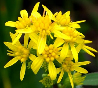
アキノキリンソウ (秋の麒麟草) キク科