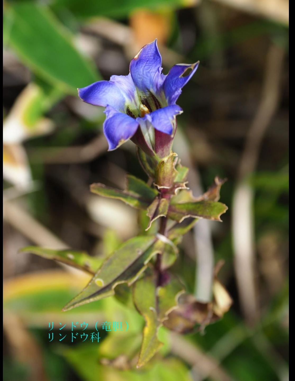
リンドウ（竜胆） リンドウ科