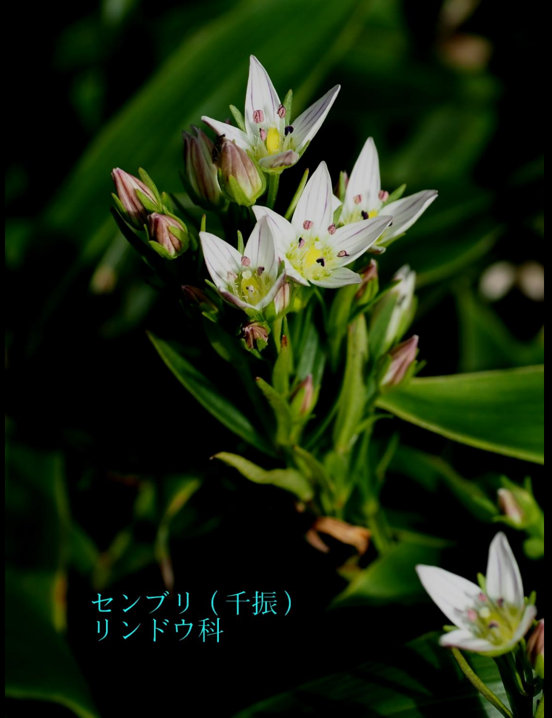
センブリ（千振） リンドウ科