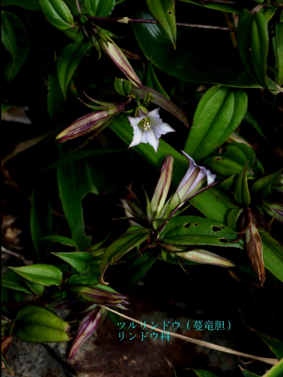
ツルリンドウ（蔓竜胆） リンドウ科