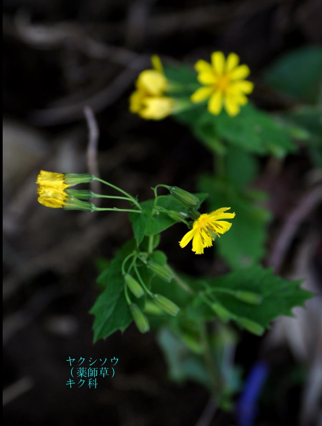
ヤクシソウ (薬師草) キク科