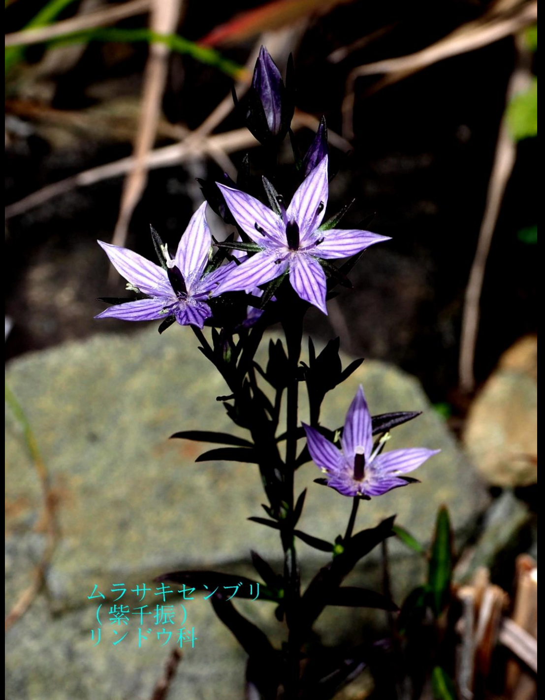
ムラサキセンブリ (紫千振) リンドウ科