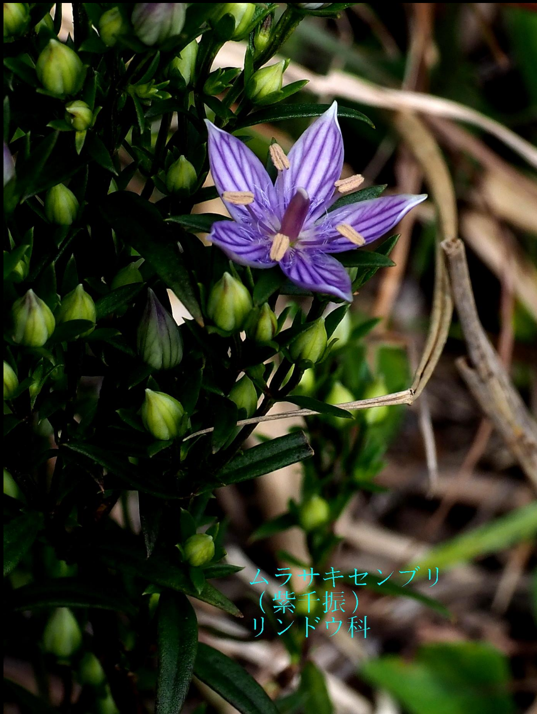
ムラサキセンブリ (紫千振) リンドウ科