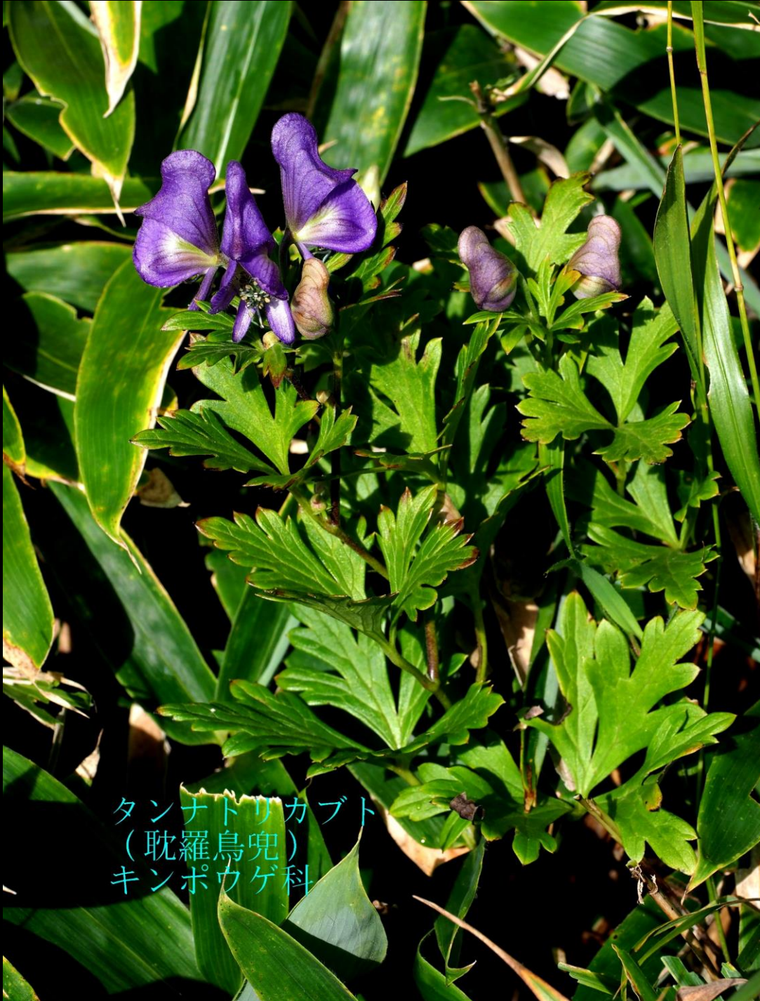
タンナトリカブト (耽羅烏兜) キンポウゲ科