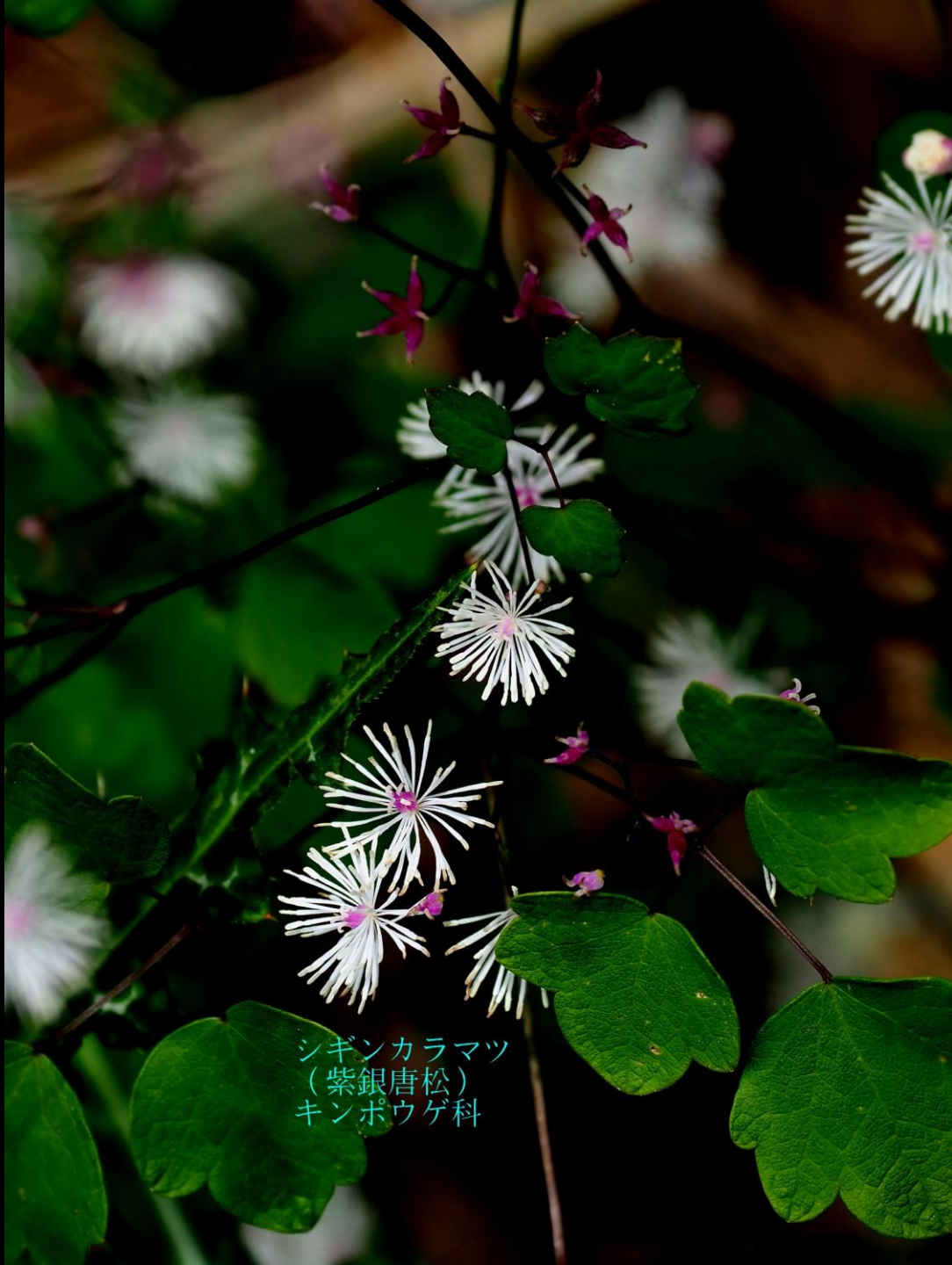
シギンカラマツ (紫銀唐松) キンポウゲ科