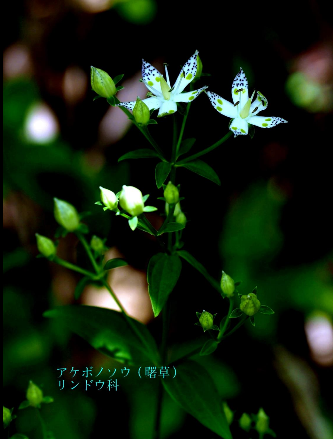
アケボノソウ（曙草） リンドウ科