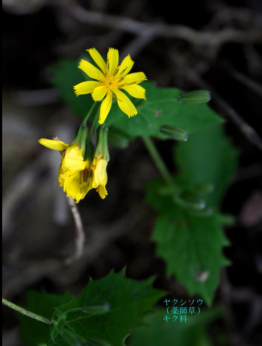
ヤクシソウ (薬師草) キク科