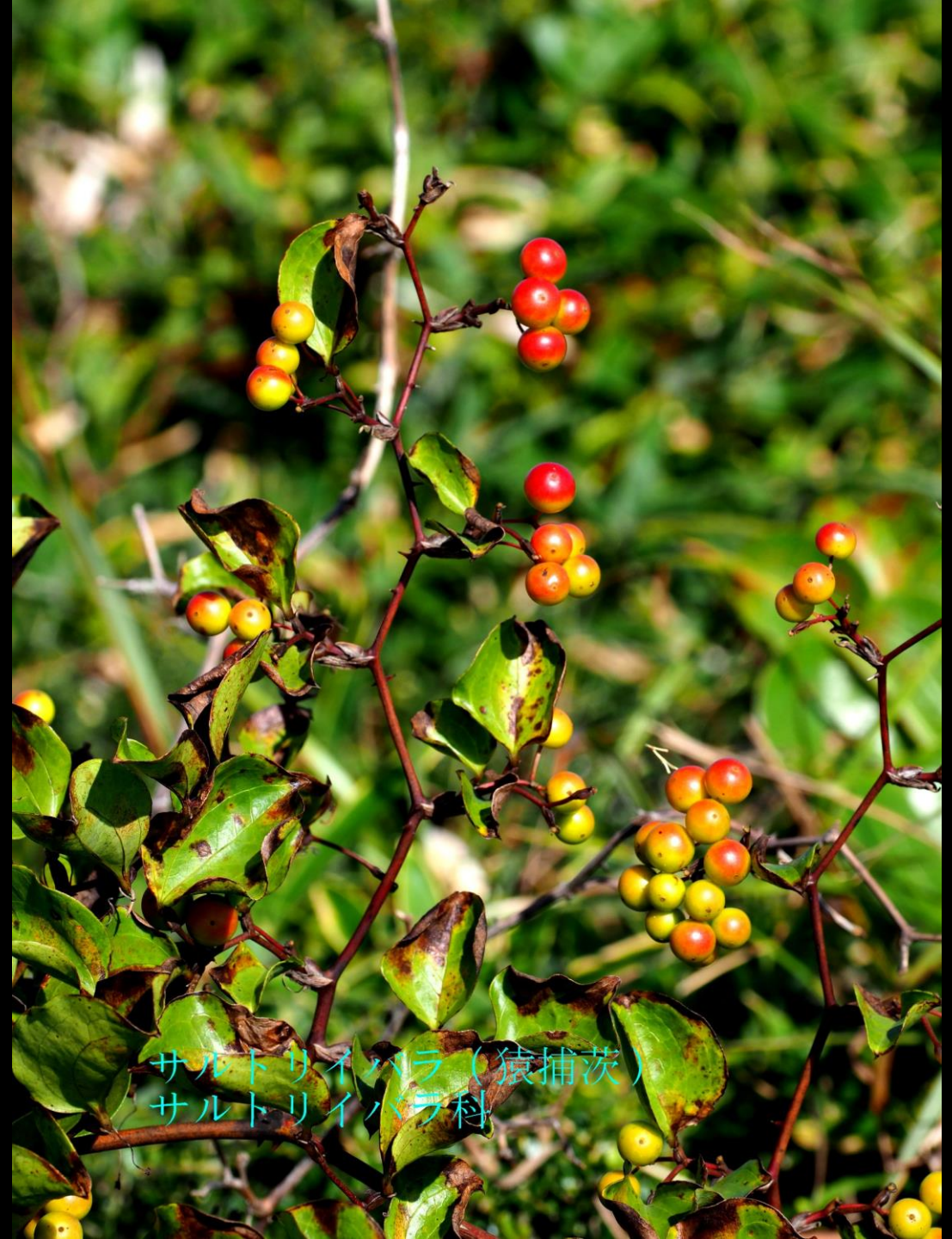
サルトリイバラ (猿捕茨) サルトリイバラ科