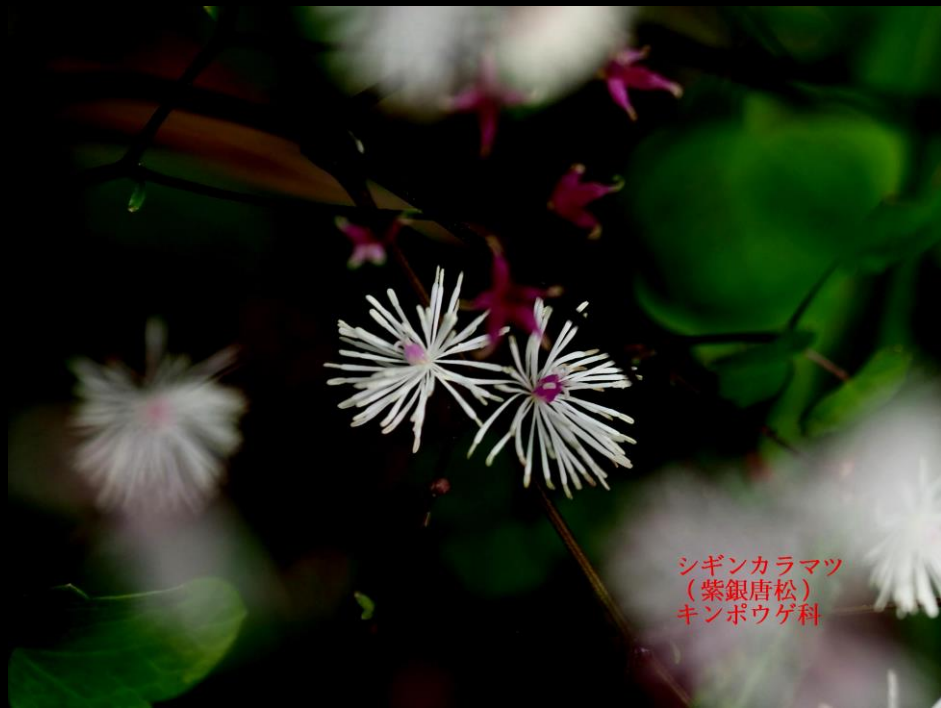
シギンカラマツ (紫銀唐松) キンポウゲ科