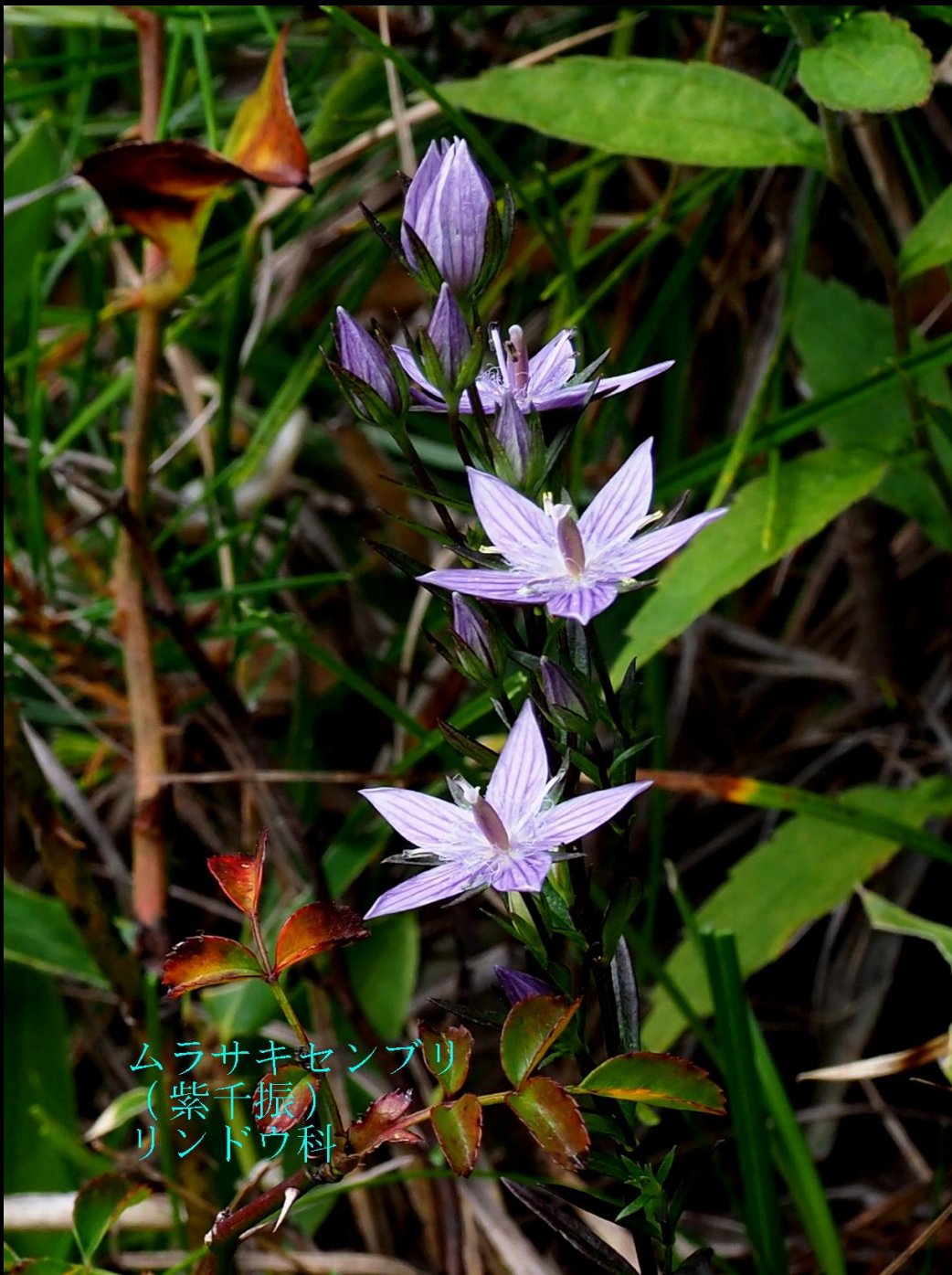
ムラサキセンブリ (紫千振) リンドウ科