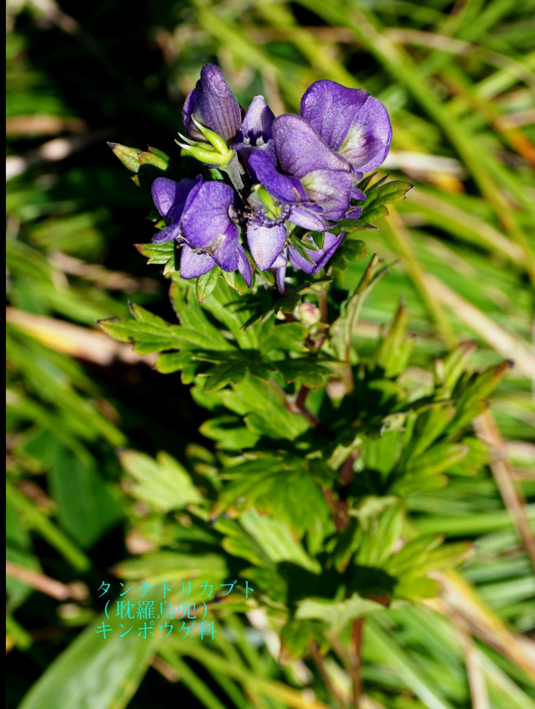
タンナトリカブト (耽羅烏兜) キンポウゲ科