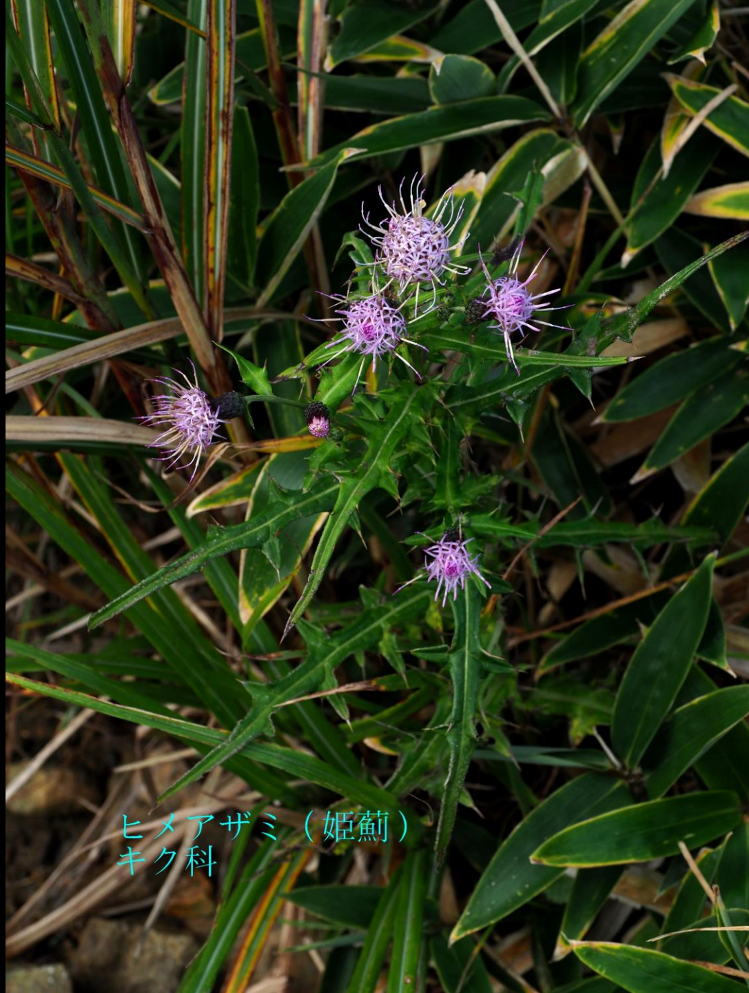
ヒメアザミ (姫薊) キク科