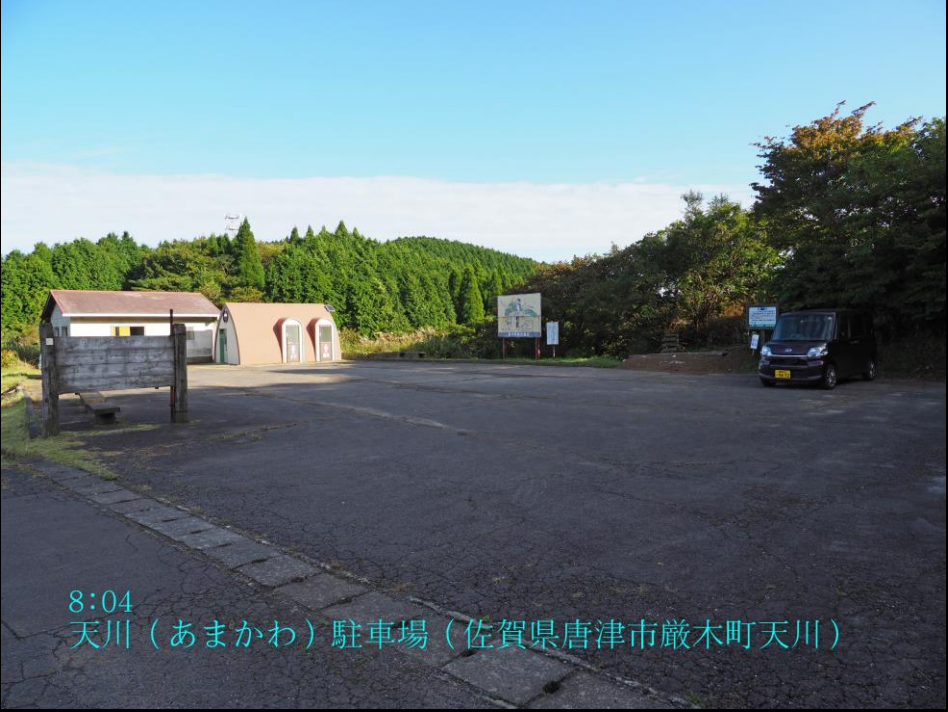
8:04 天川（あまかわ）駐車場（佐賀県唐津市厳木町天川）