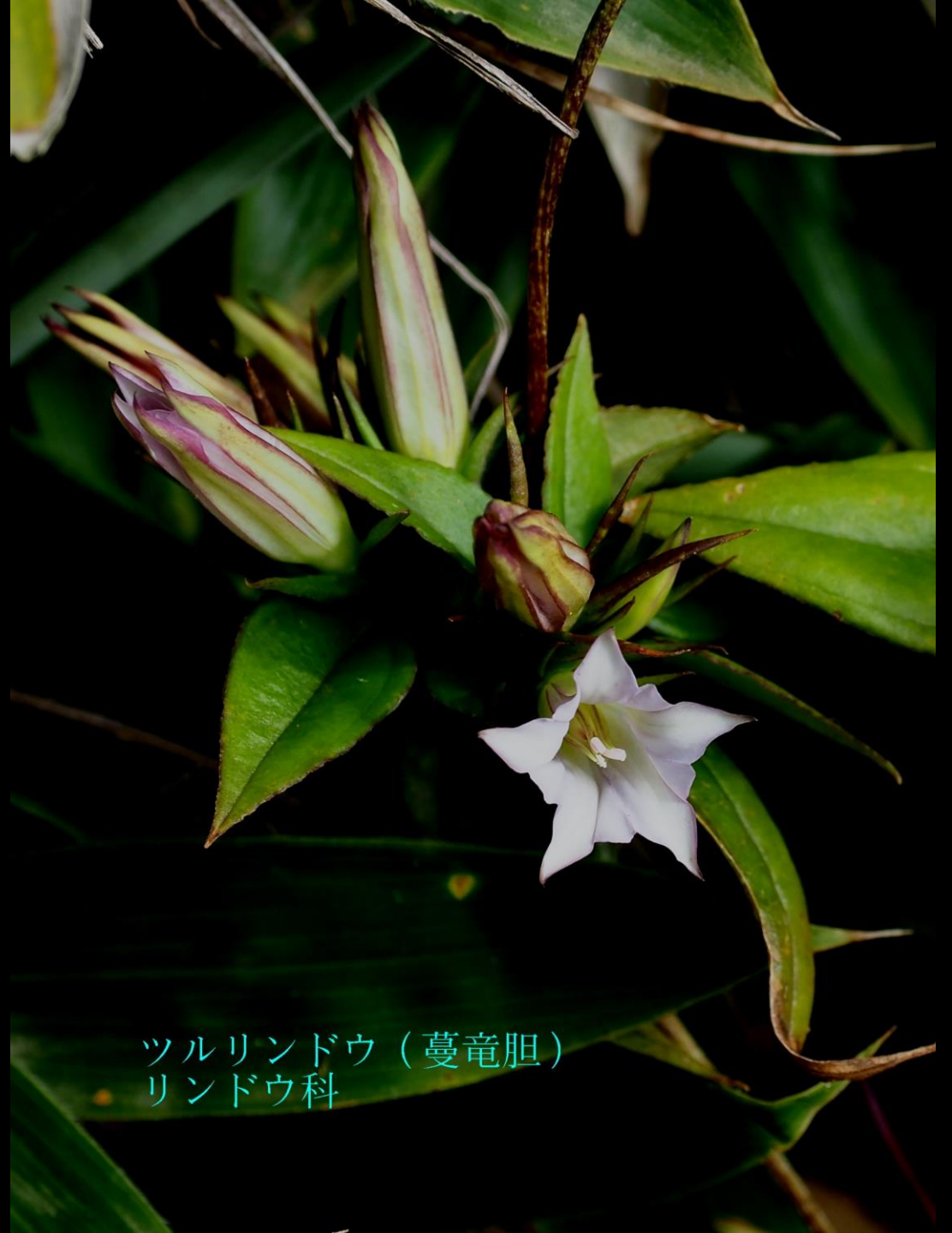
ツルリンドウ（蔓竜胆） リンドウ科