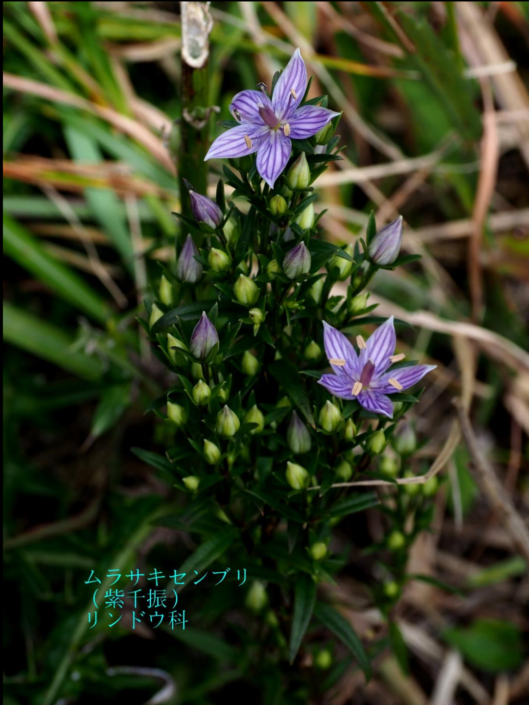
ムラサキセンブリ (紫千振) リンドウ科