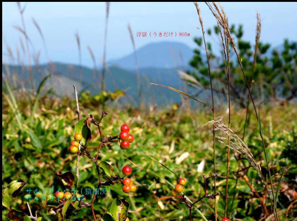
浮嶽 (うきだけ) 805m