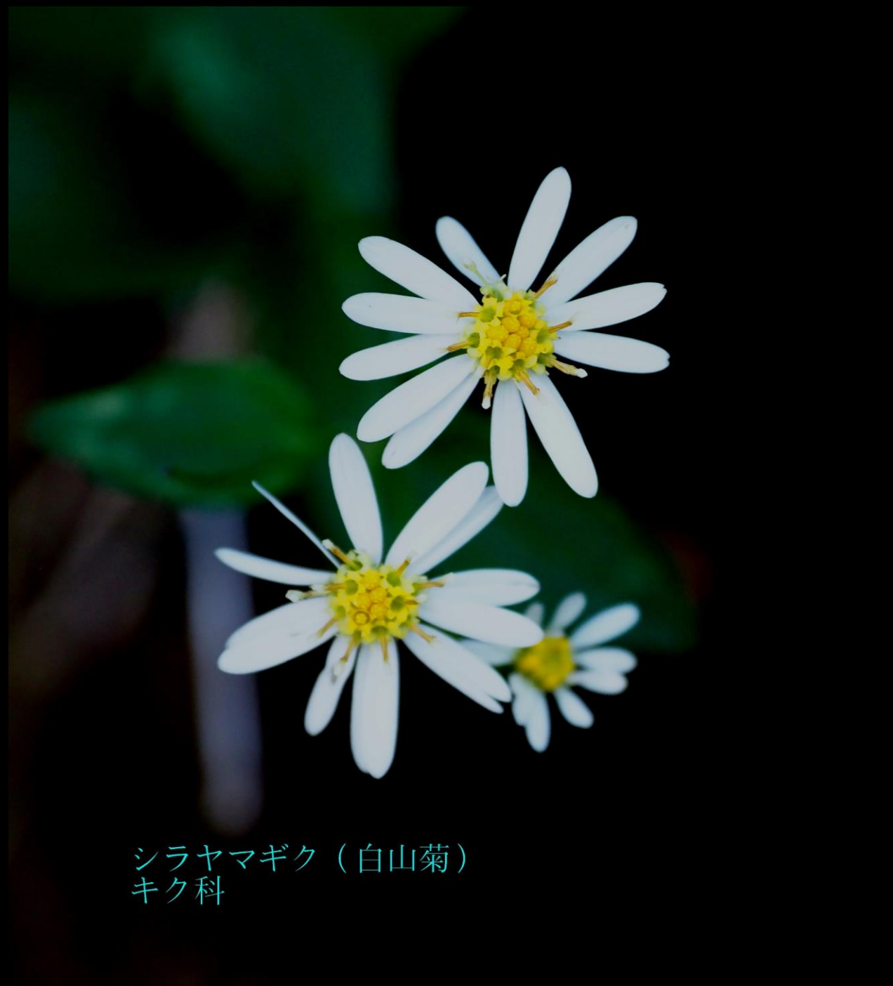
シラヤマギク (白山菊) キク科