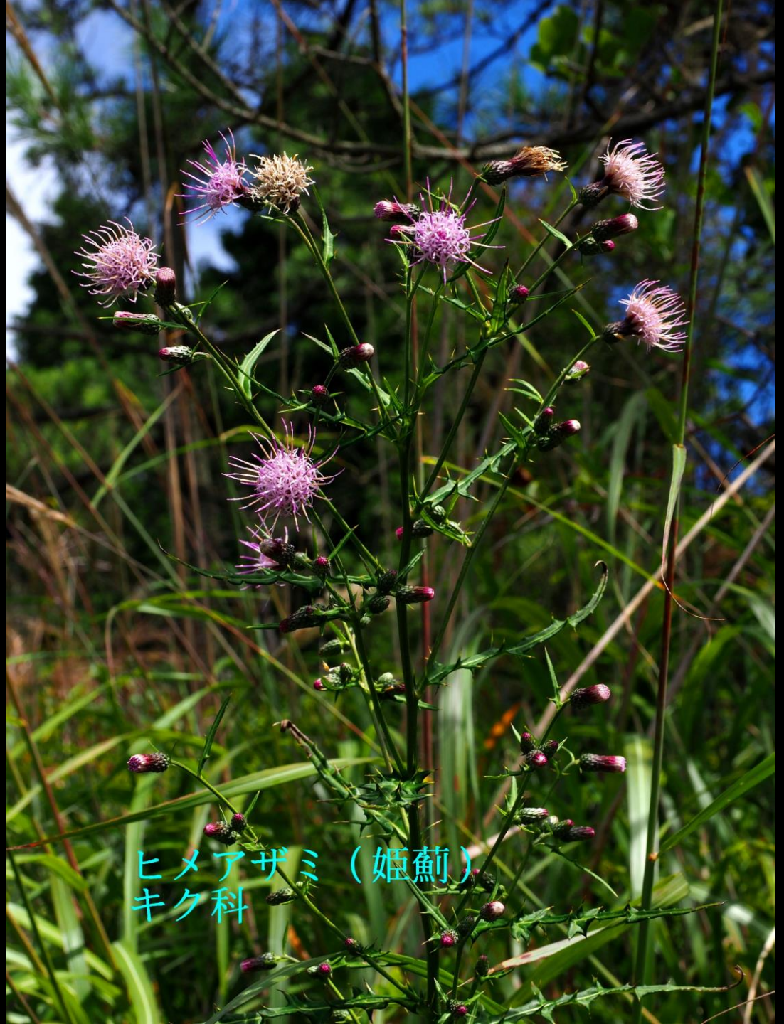
ヒメアザミ (姫薊) キク科