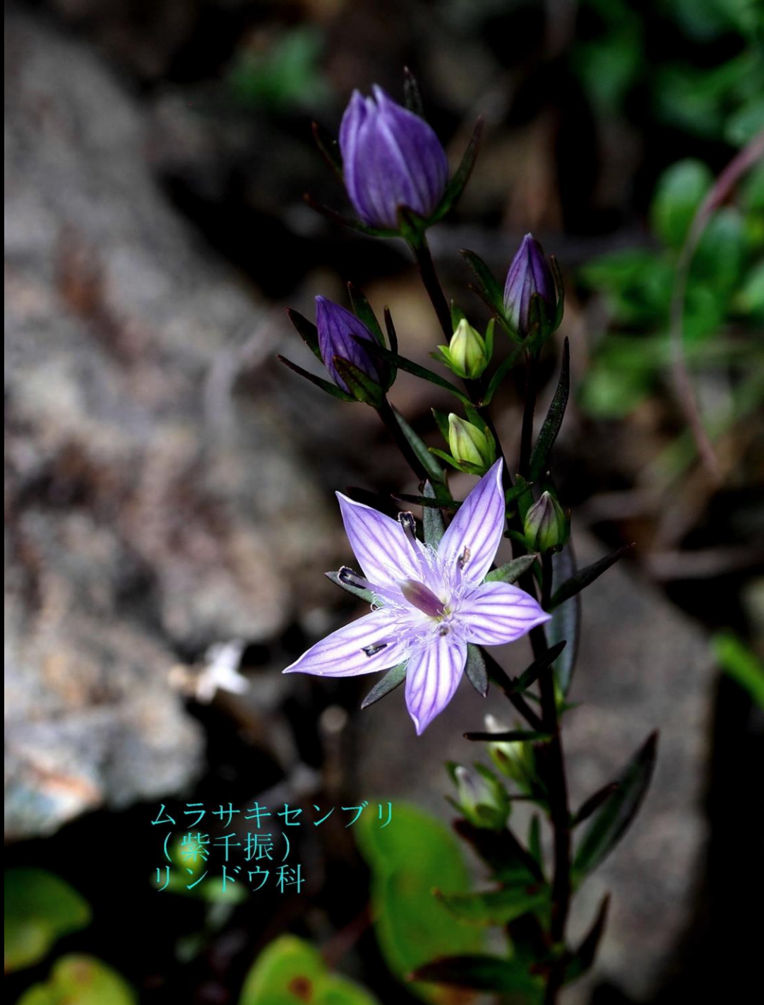
ムラサキセンブリ (紫千振) リンドウ科