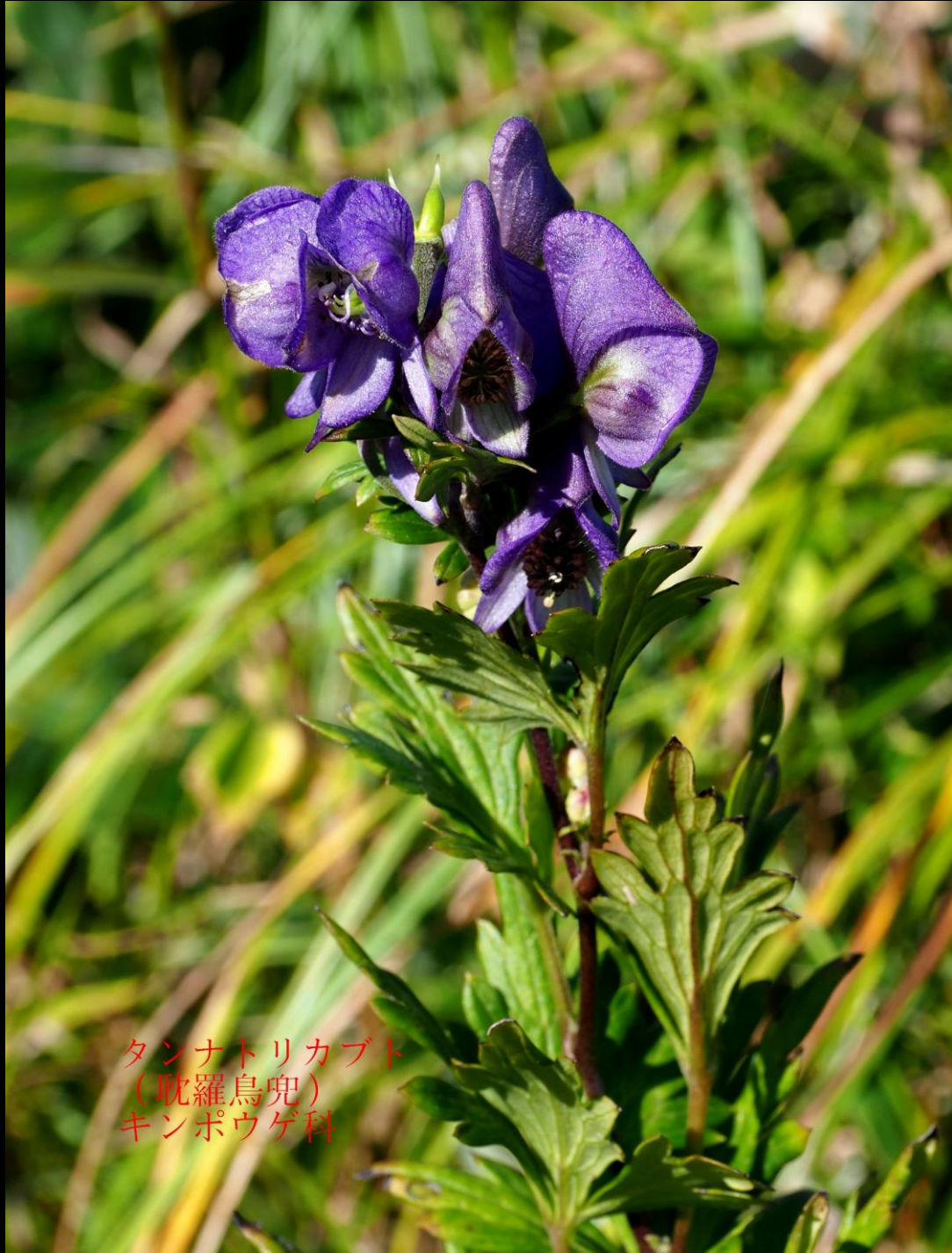
タンナトリカブト (耽羅烏兜) キンポウゲ科