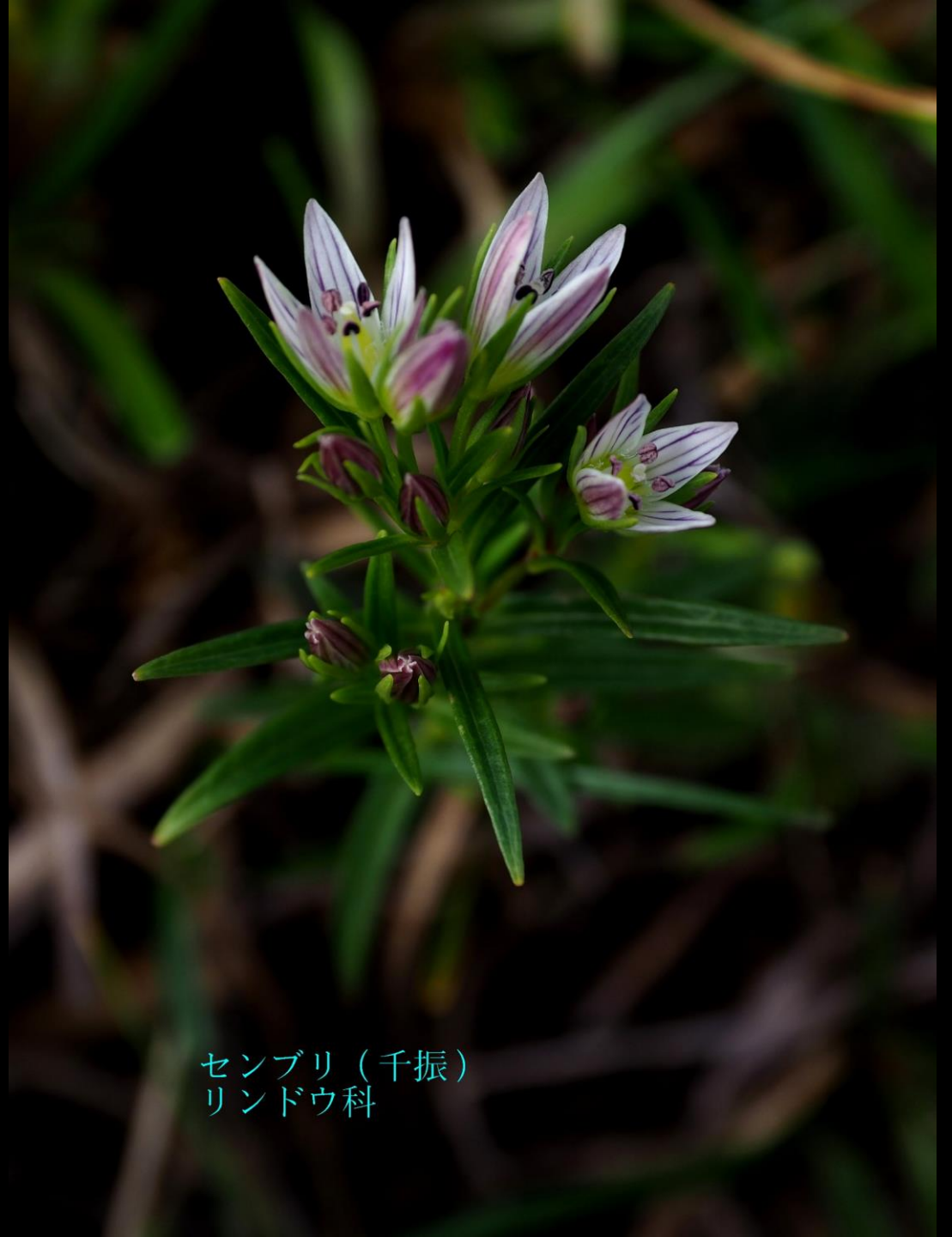
センブリ (千振) リンドウ科