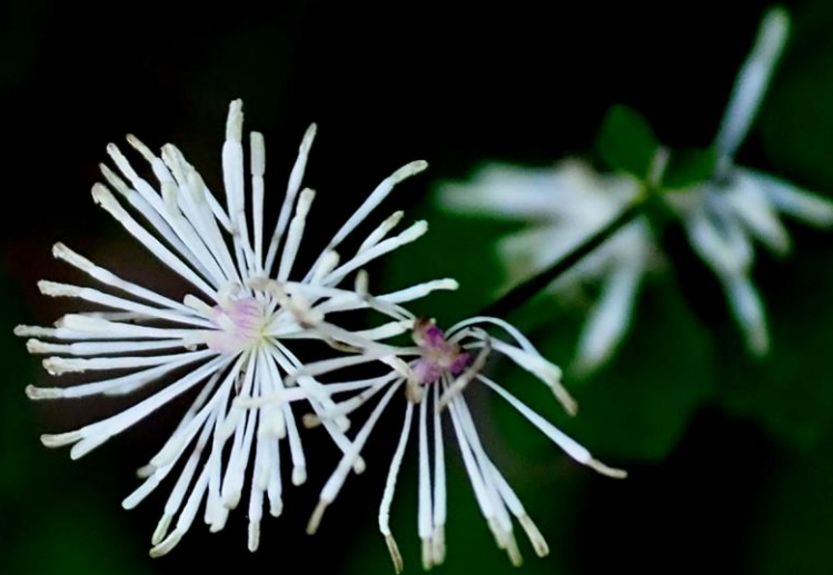
シギンカラマツ （紫銀唐松） キンポウゲ科