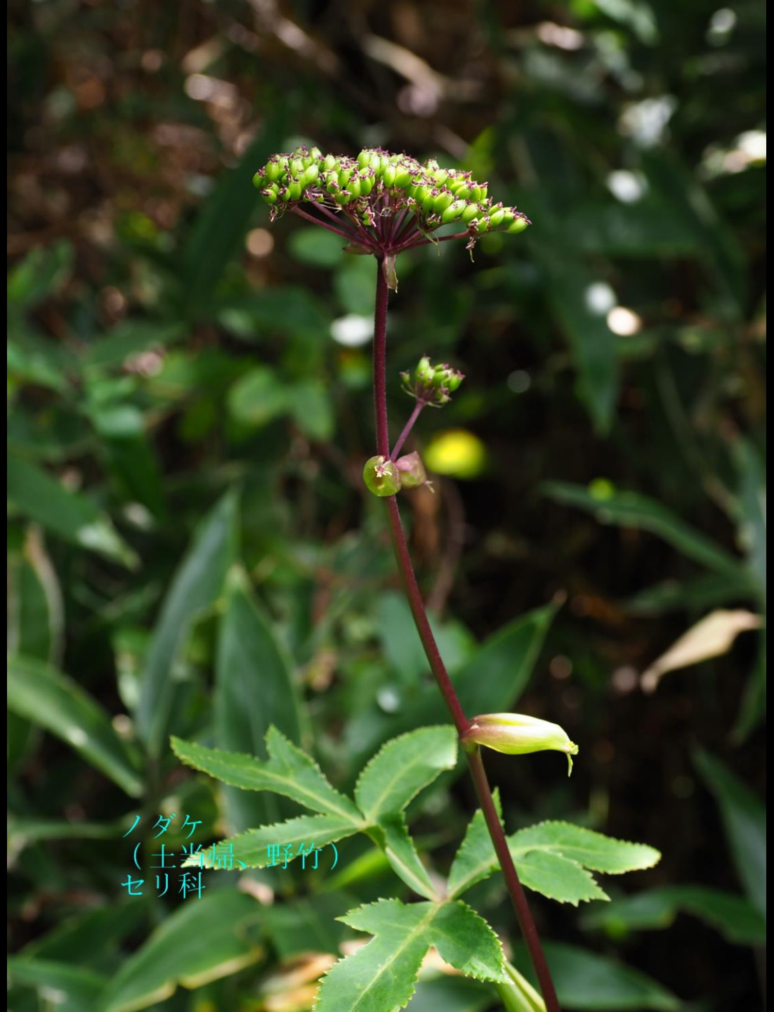
ノダケ (土当帰、野竹) セリ科