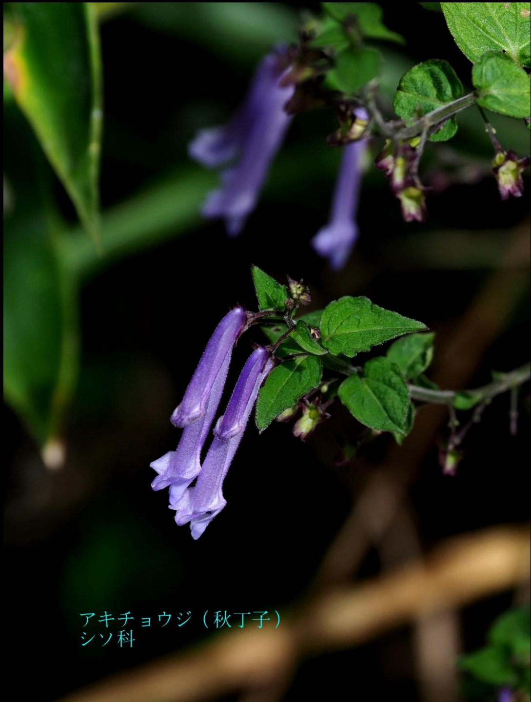
アキチョウジ (秋丁子) シソ科