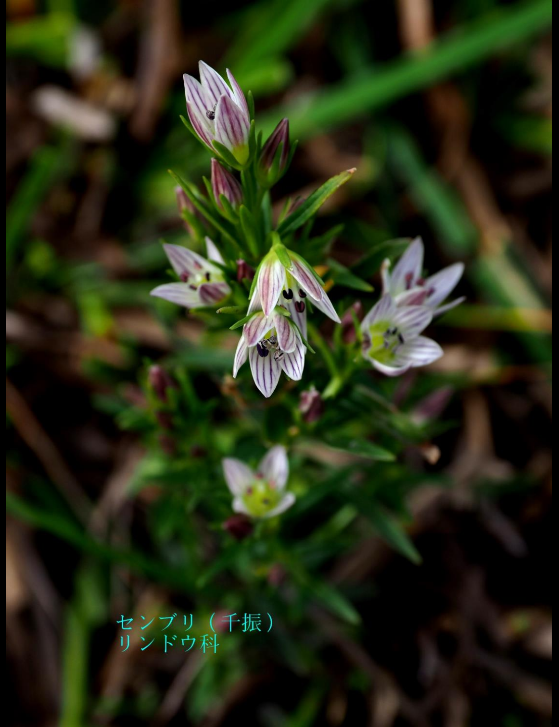
センブリ (千振) リンドウ科