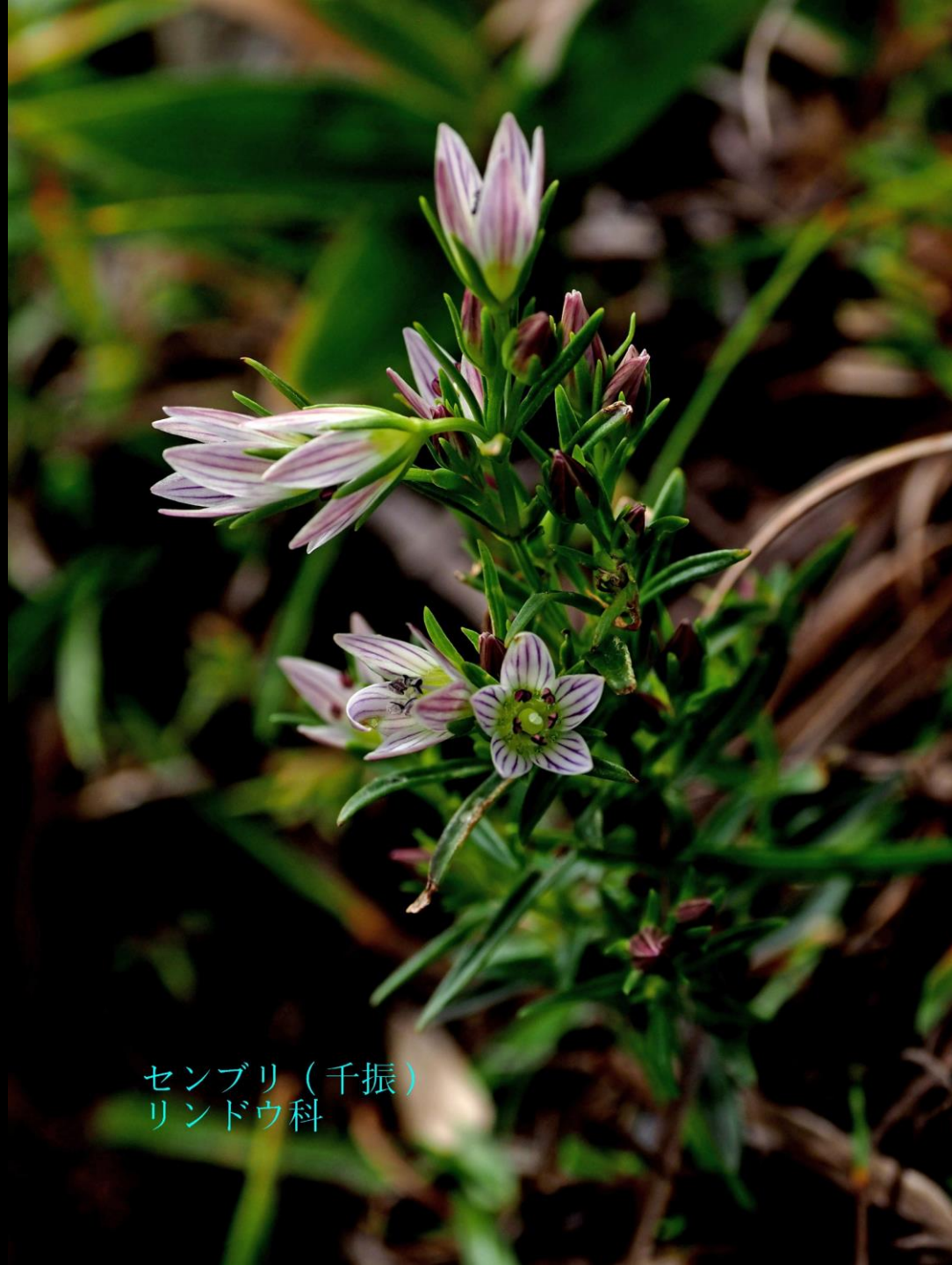
センブリ (千振) リンドウ科