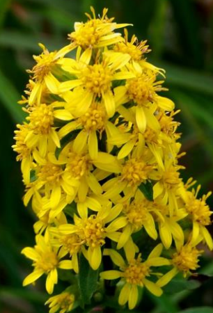
アキノキリンソウ (秋の麒麟草) キク科