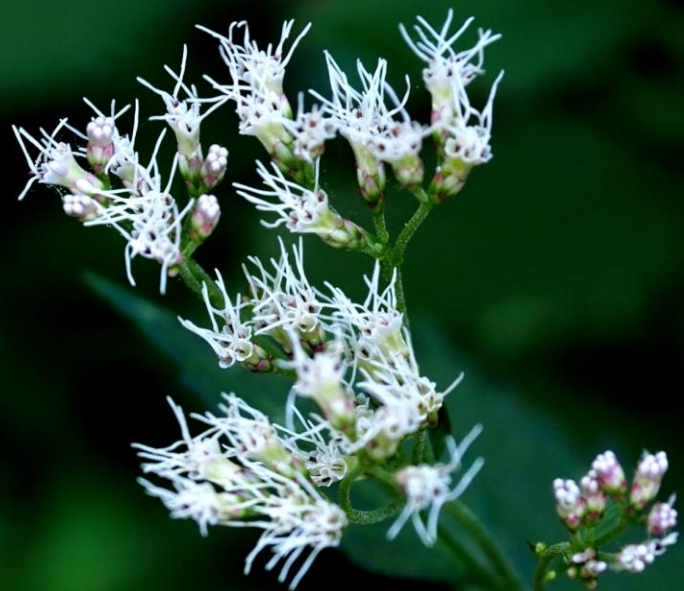
ヒヨドリバナ（鴨花） キク科