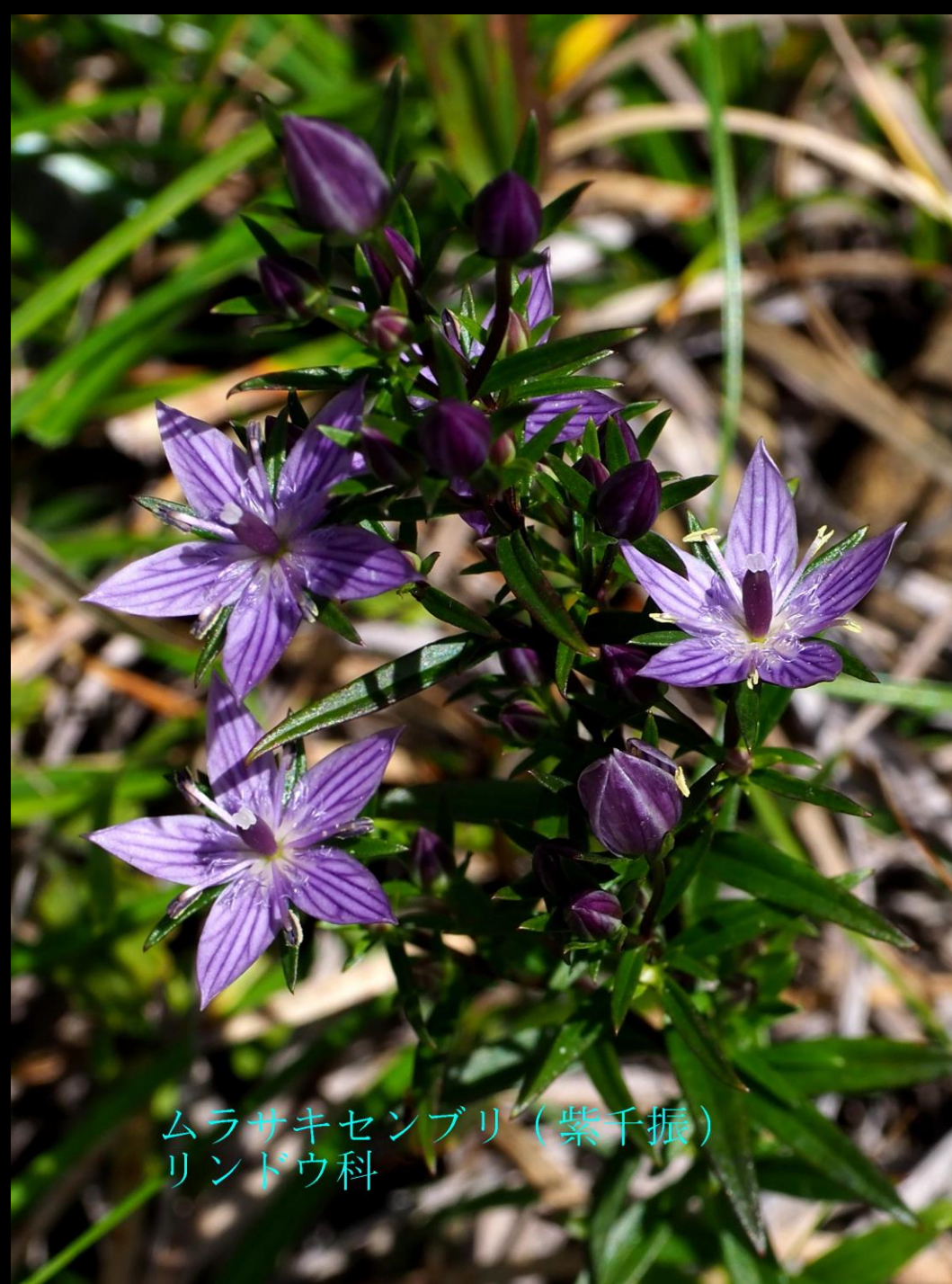
ムラサキセンブリ (紫千振) リンドウ科