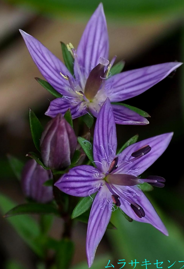
ムラサキセンブリ (紫千振) リンドウ科