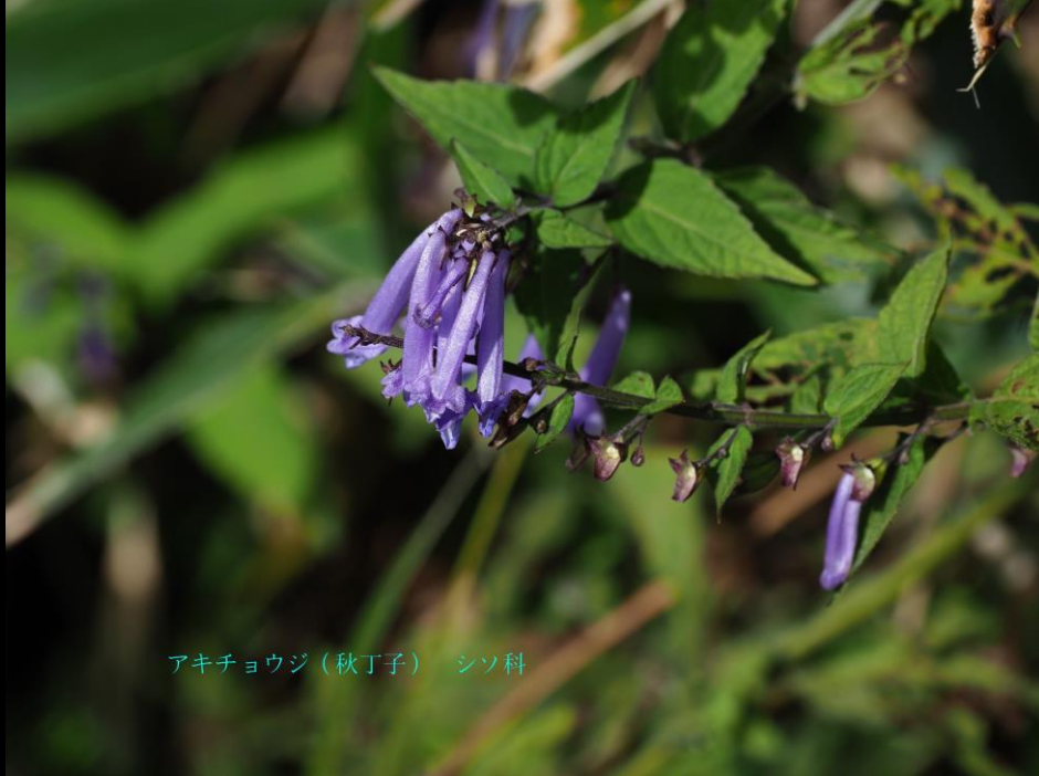
アキチョウジ (秋丁子) シソ科