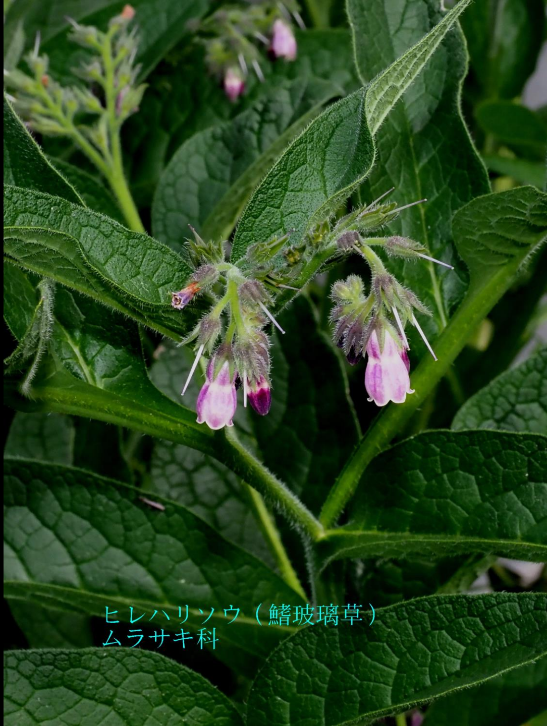
ヒレハリソウ（鱗玻璃草） ムラサキ科