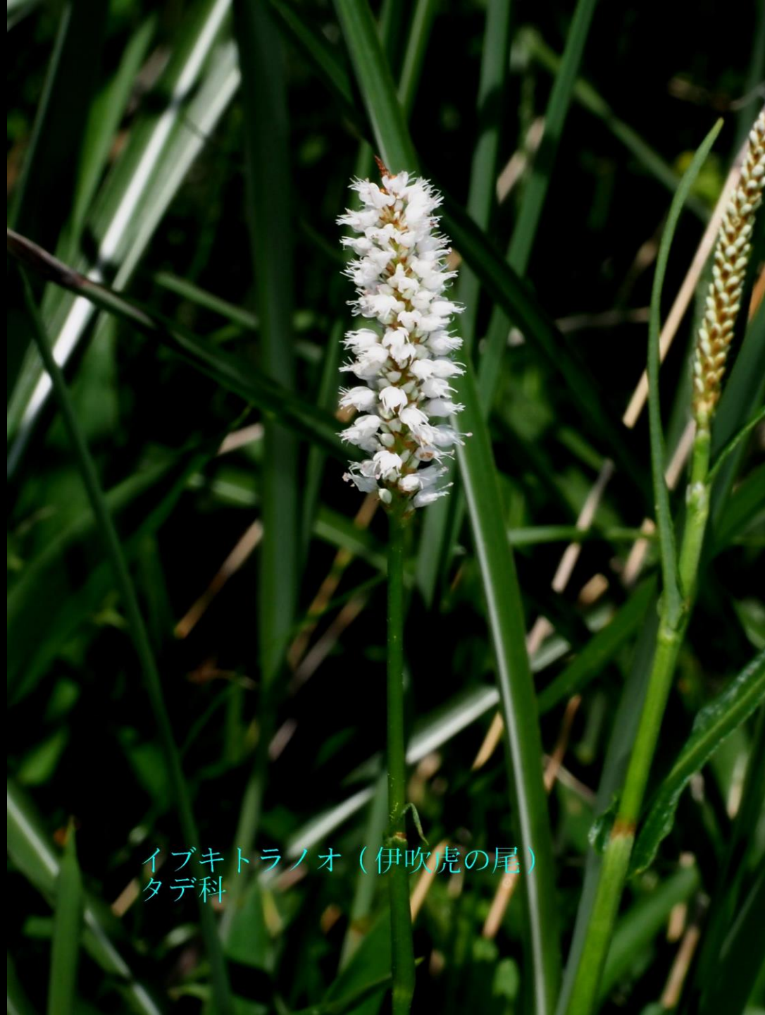
イブキトラノオ（伊吹虎の尾） タデ科