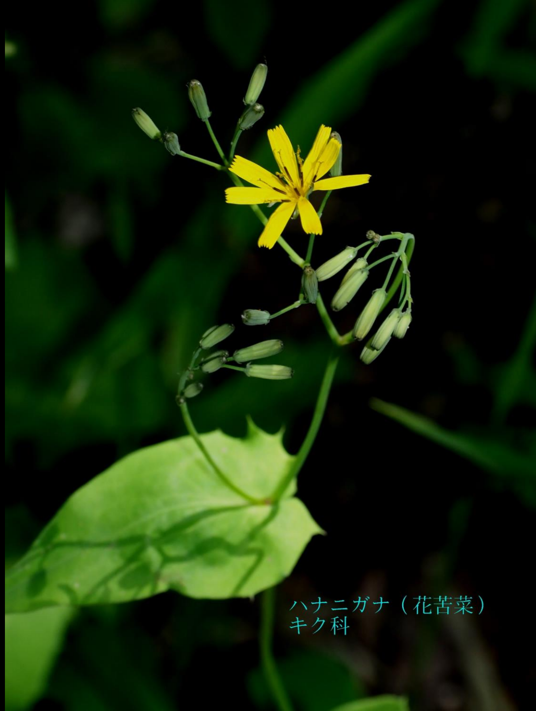
ハナニガナ（花苦菜） キク科