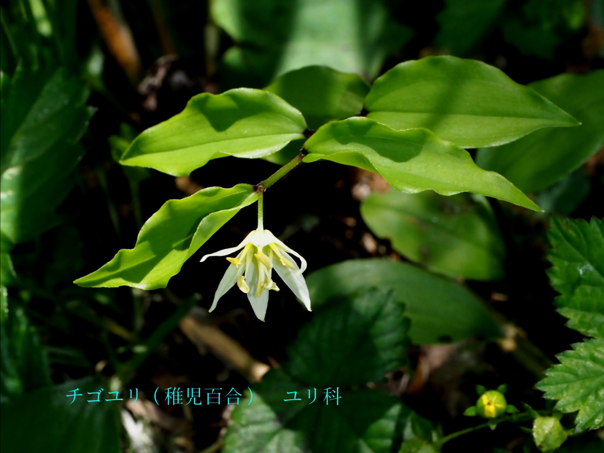
チゴユリ（稚児百合） ユリ科