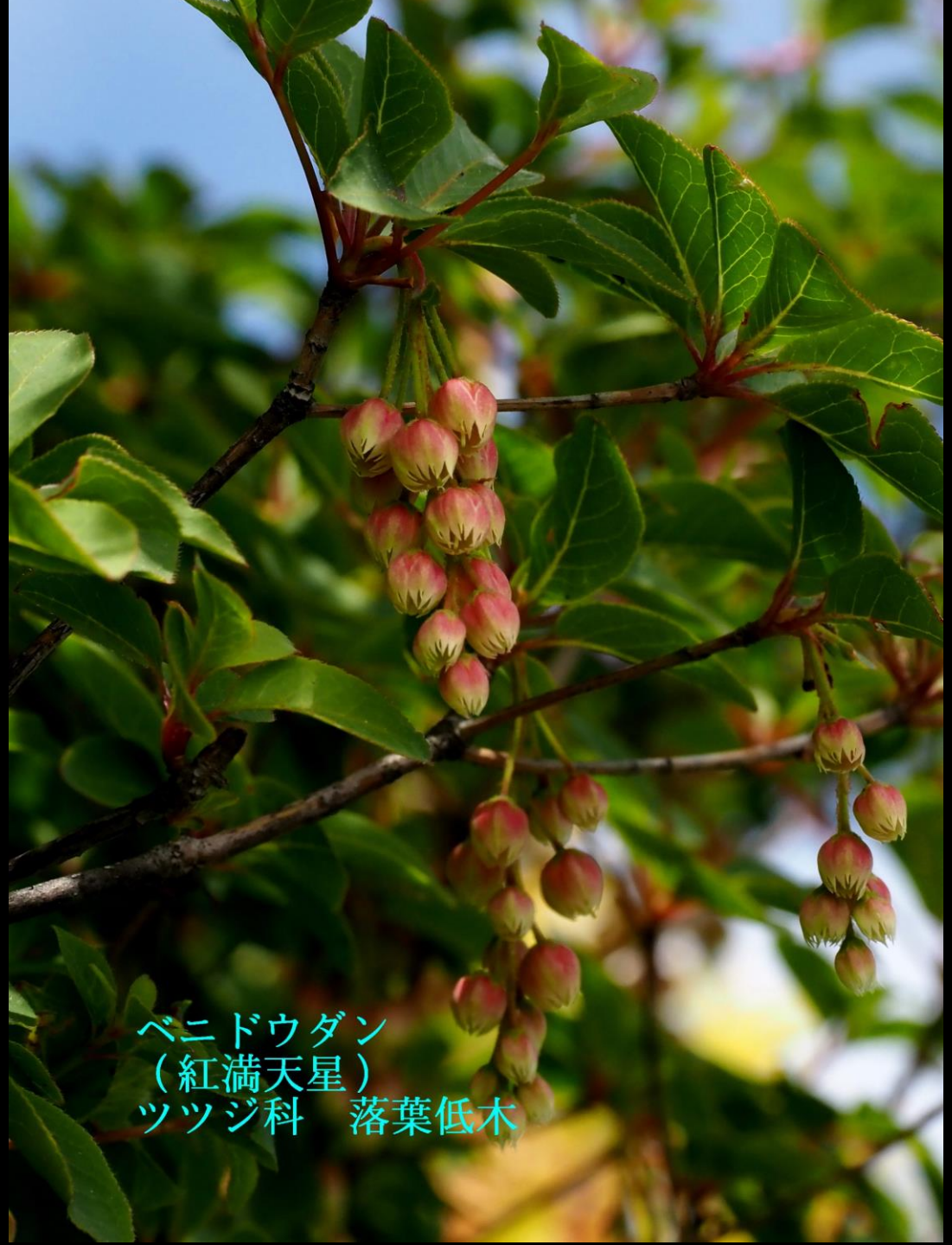
ベニドウダン (紅満天星) ツツジ科 落葉低木