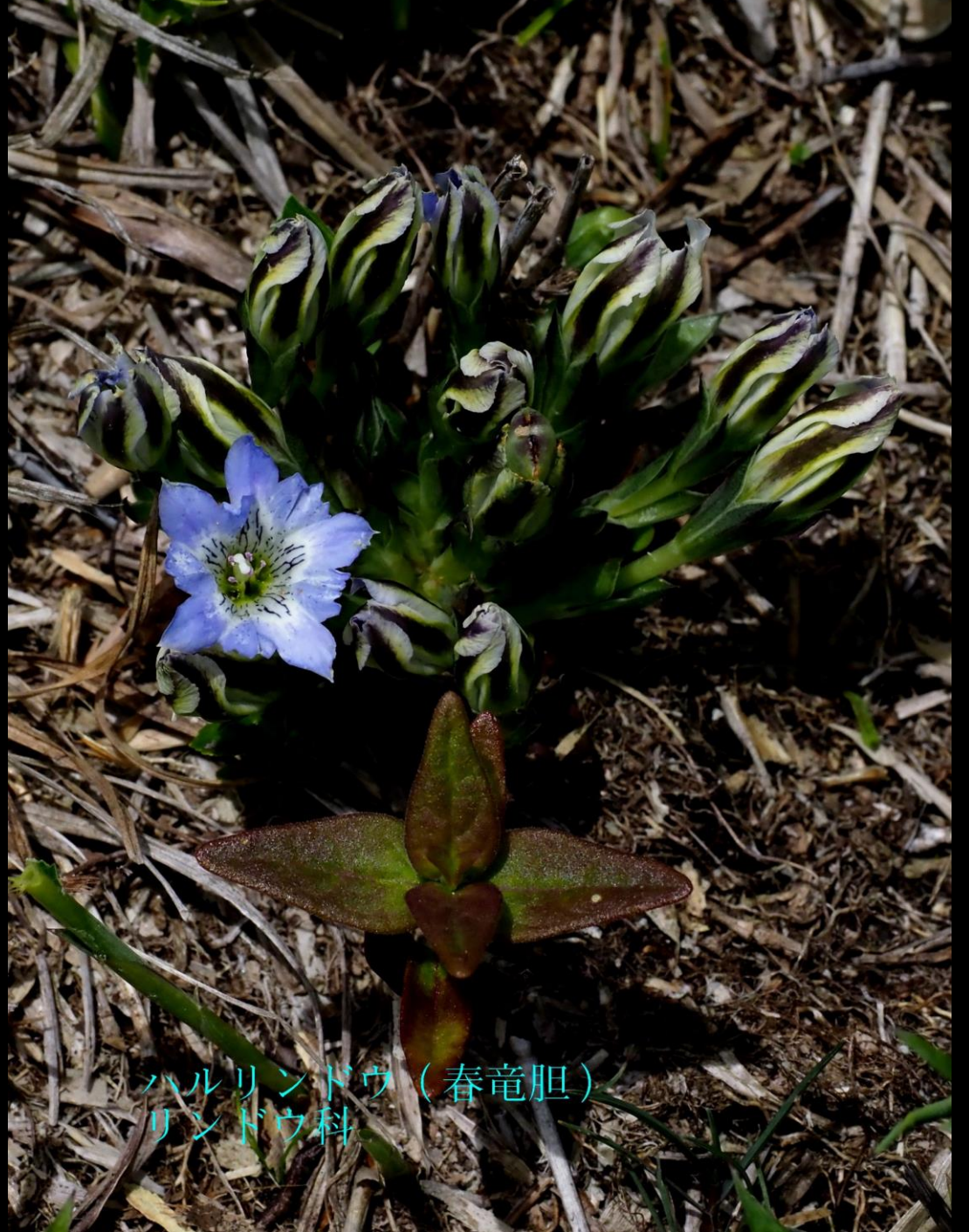
ハルリンドウ (春竜胆) リンドウ科