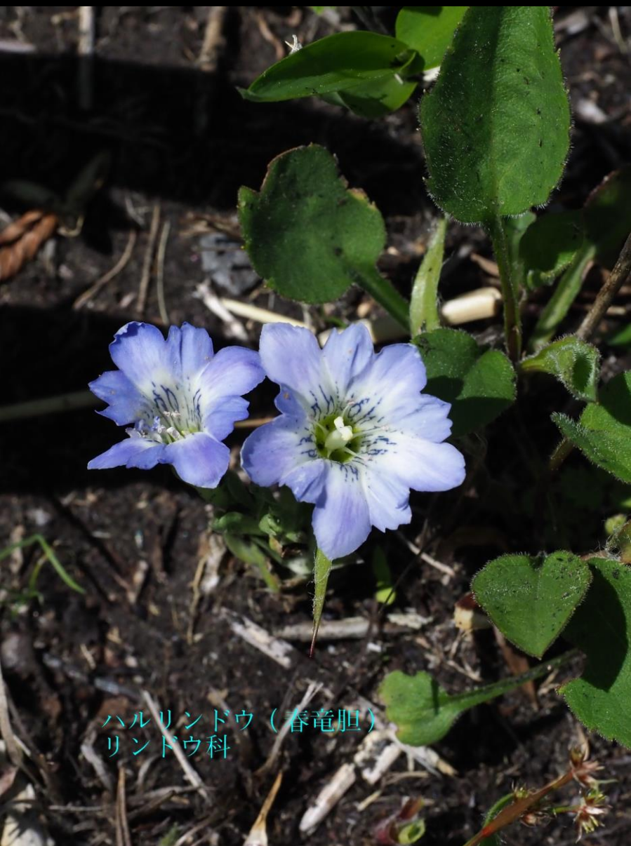
ハルリンドウ（春竜胆） リンドウ科