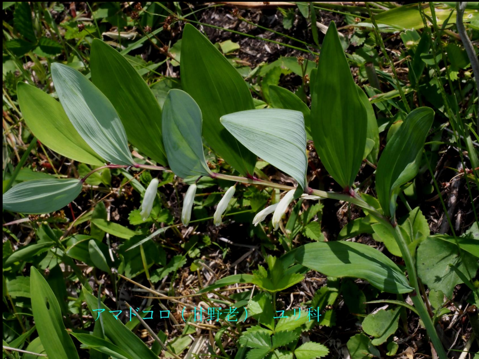
アマドコロ（甘野老） ユリ科