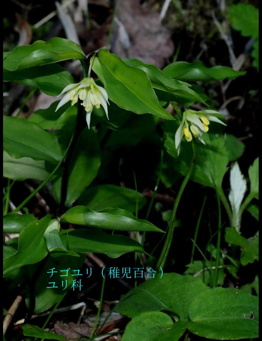
チゴユリ（稚児百合） ユリ科