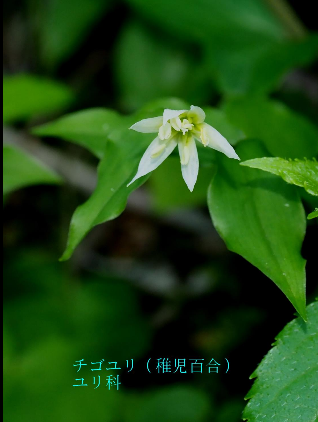
チゴユリ（稚児百合） ユリ科