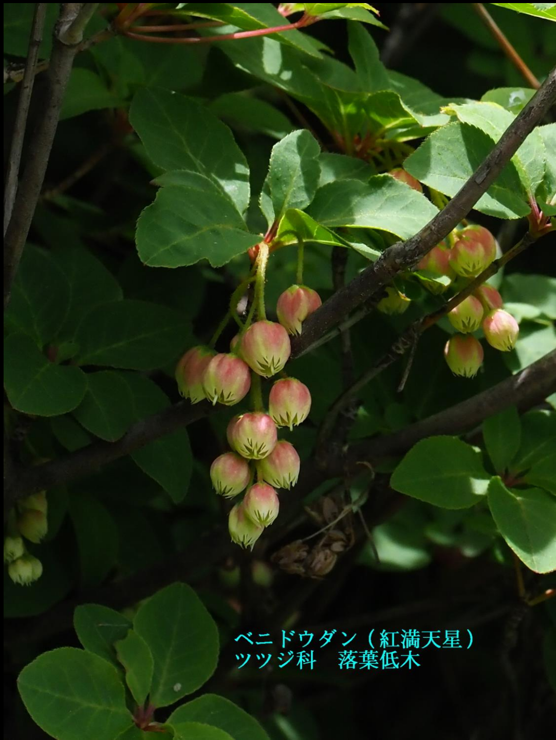
ベニドウダン (紅満天星) ツツジ科 落葉低木