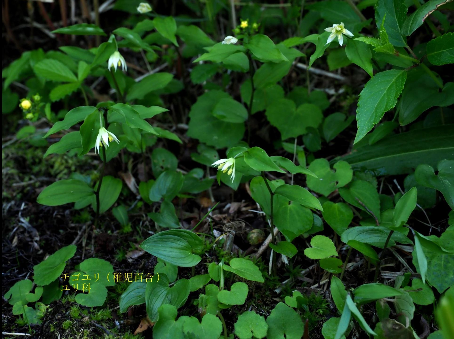
チゴユリ (稚児百合) ユリ科