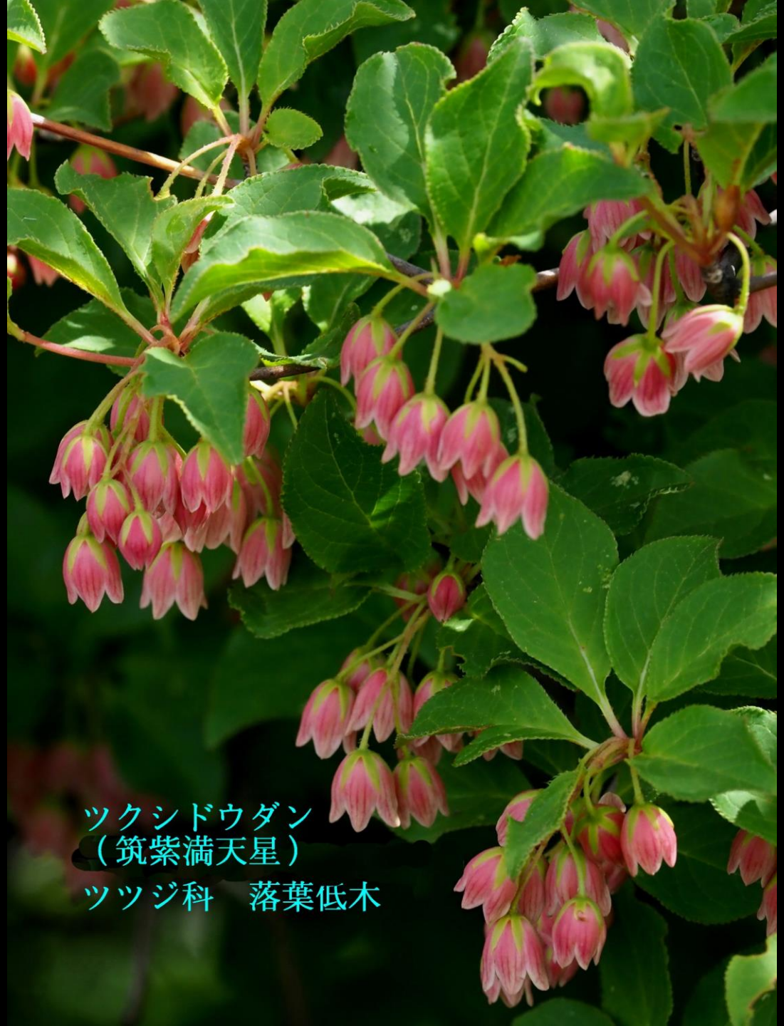
ツクシドウダン （筑紫満天星） ツツジ科 落葉低木