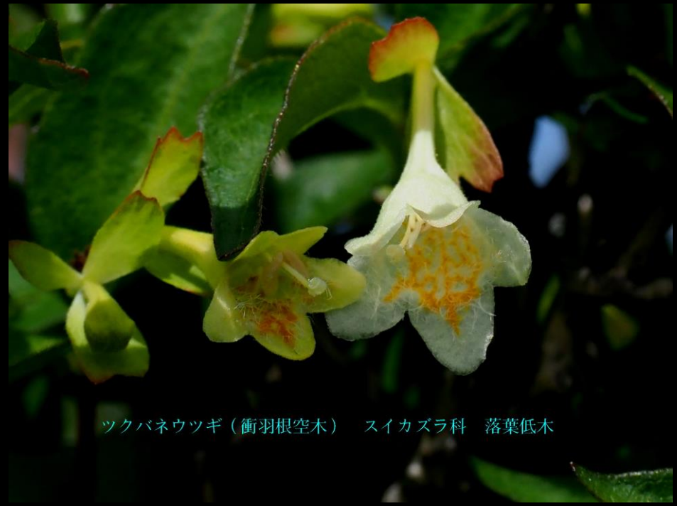
ツクバネウツギ (衝羽根空木) スイカズラ科 落葉低木