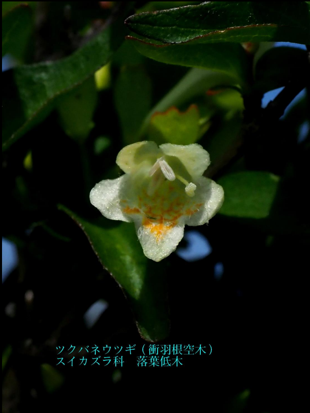
ツクバネウツギ (衝羽根空木) スイカズラ科 落葉低木