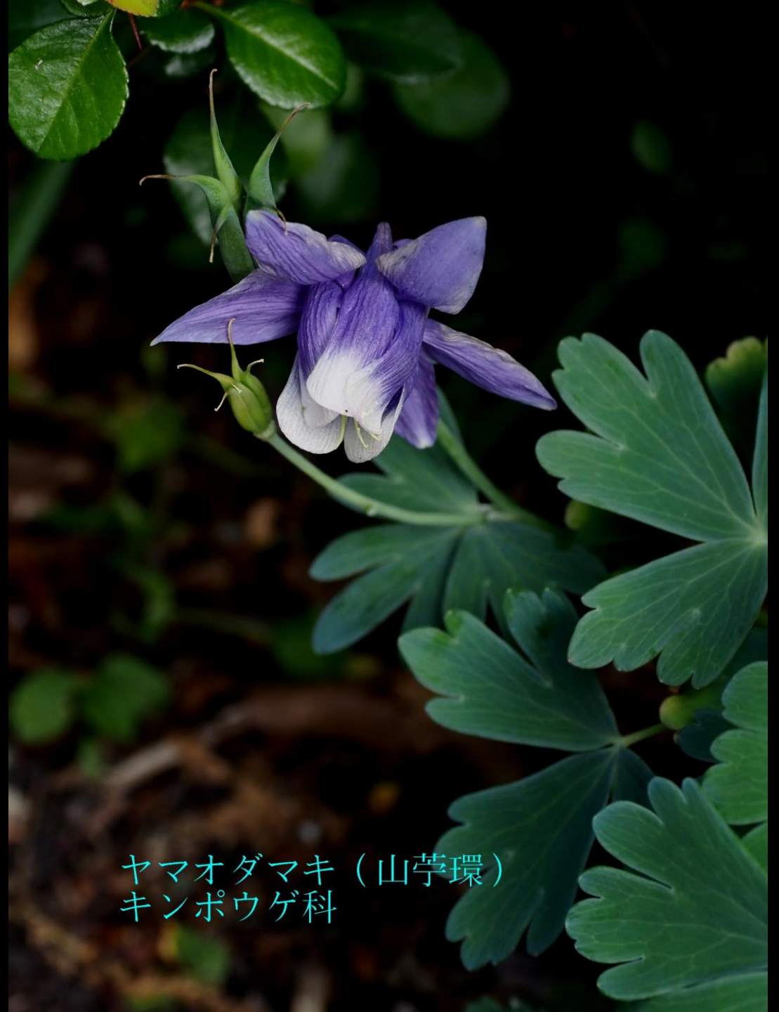
ヤマオダマキ（山苧環） キンポウゲ科