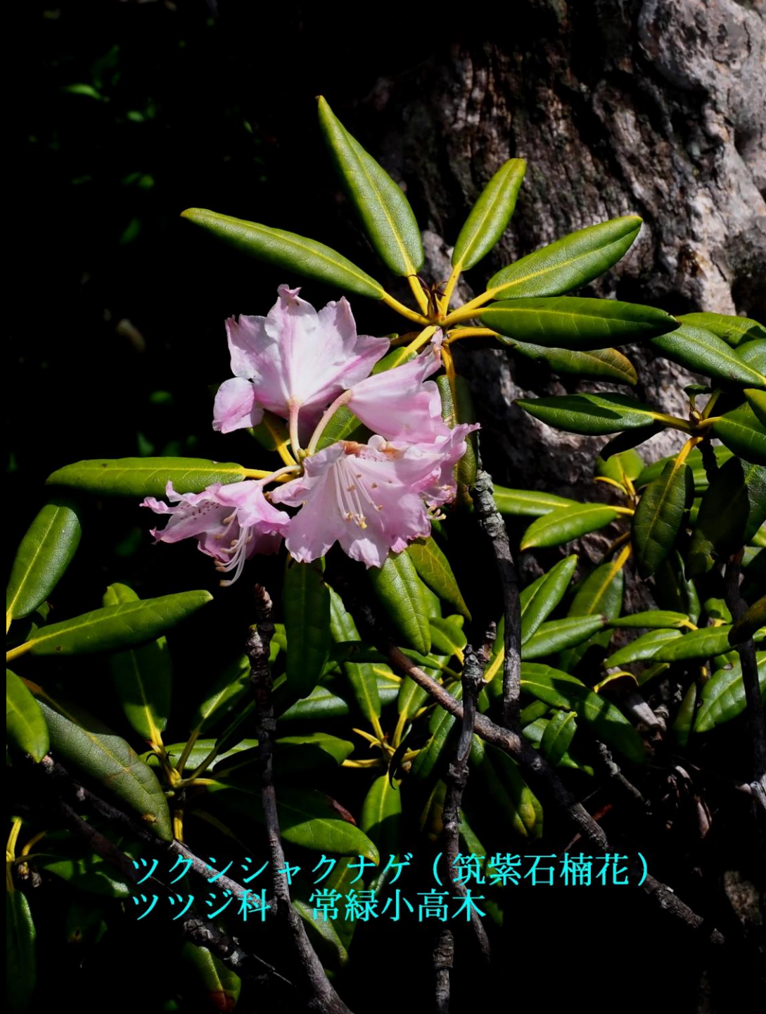
ツクシシャクナゲ（筑紫石楠花） ツツジ科 常緑小高木