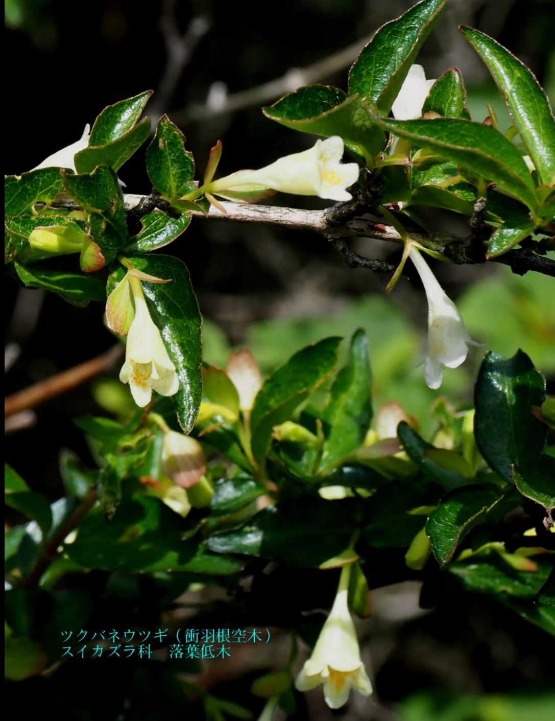
ツクバネウツギ (衝羽根空木) スイカズラ科 落葉低木