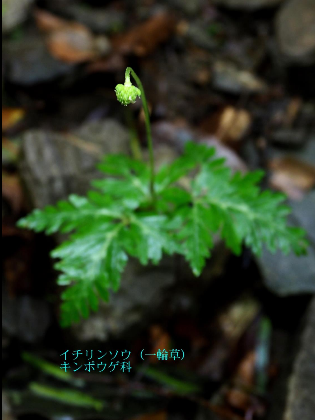
イチリンソウ (一輪草) キンポウゲ科