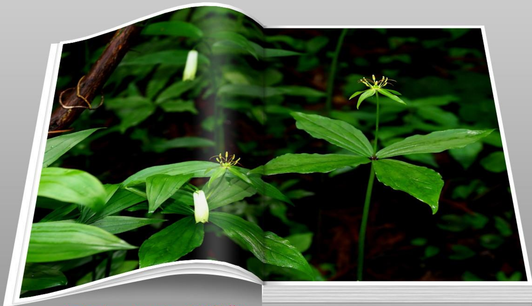
ホウチャクソウ (宝鐸草) ユリ科