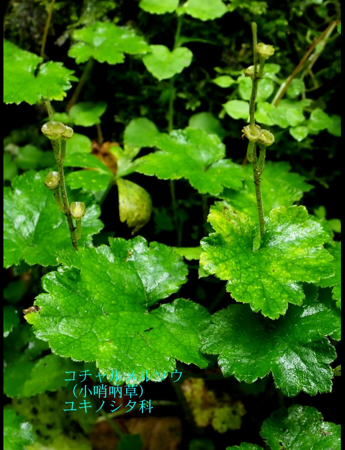
コチャルメルソウ (小哨唎草) ユキノシタ科