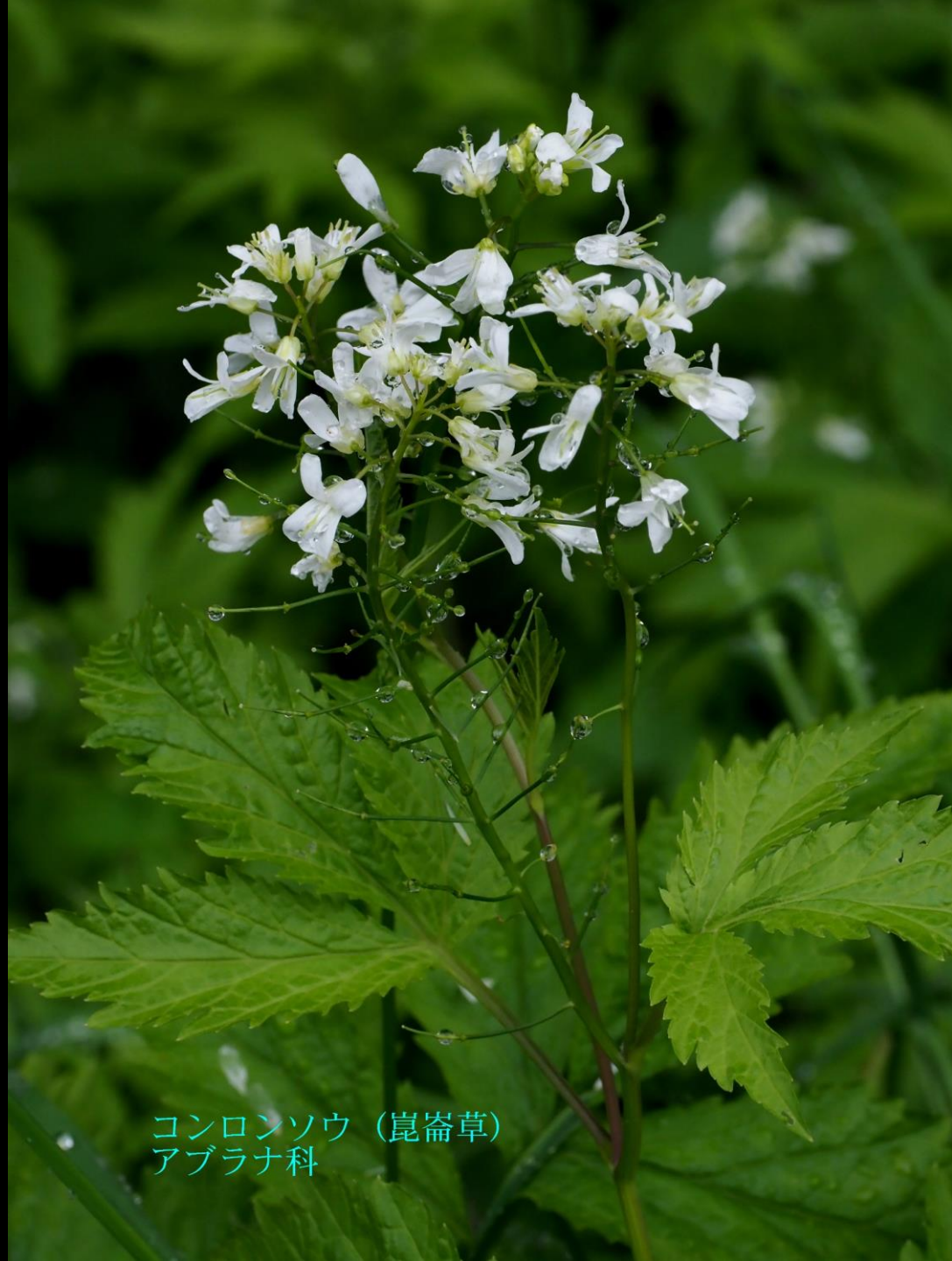
コンロンソウ（崑崙草） アブラナ科