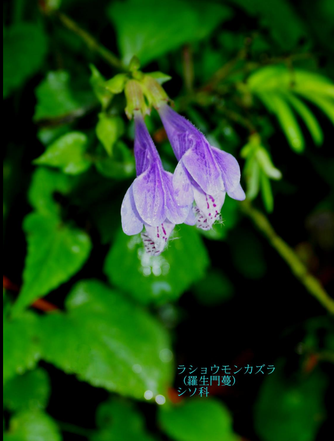
ラショウモンカズラ (羅生門蔓) シソ科