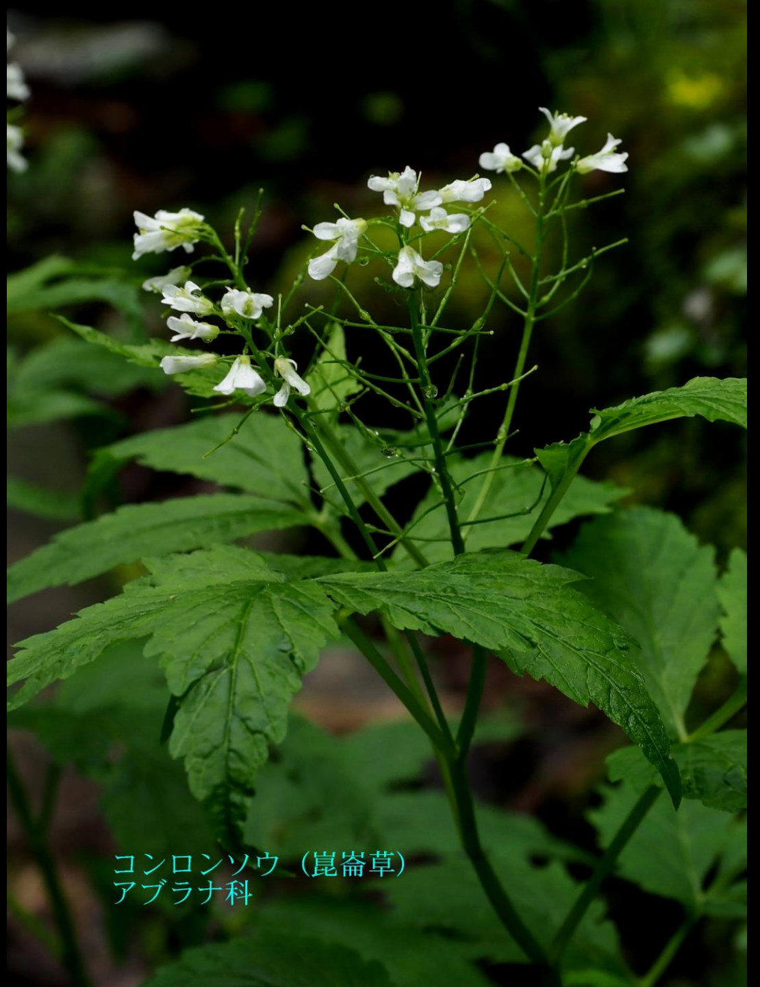
コンロンソウ（崑崙草） アブラナ科