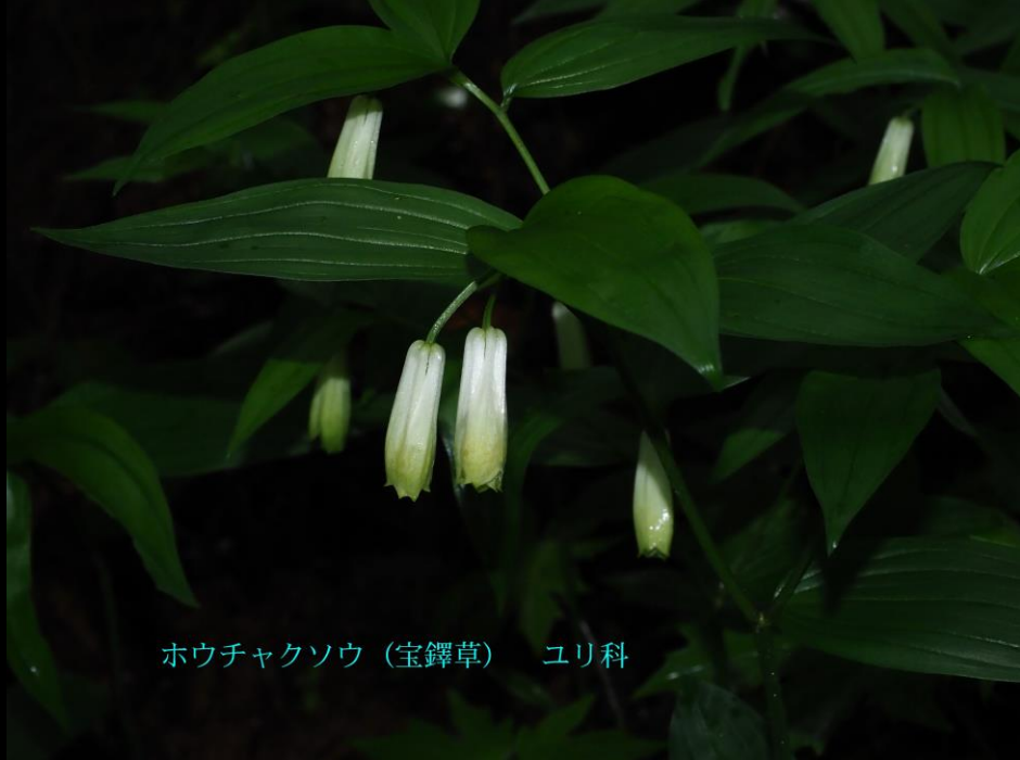
ホウチャクソウ (宝鐸草) ユリ科