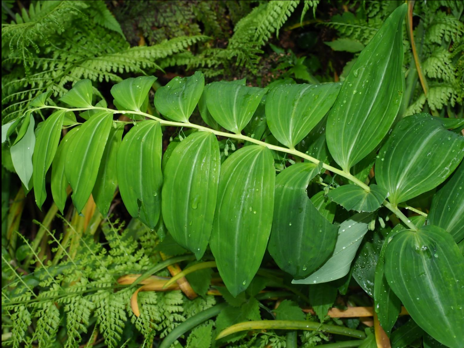
オオナルコユリ (大鳴子百合) ユリ科