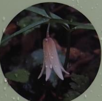
ホソバナコバイモ