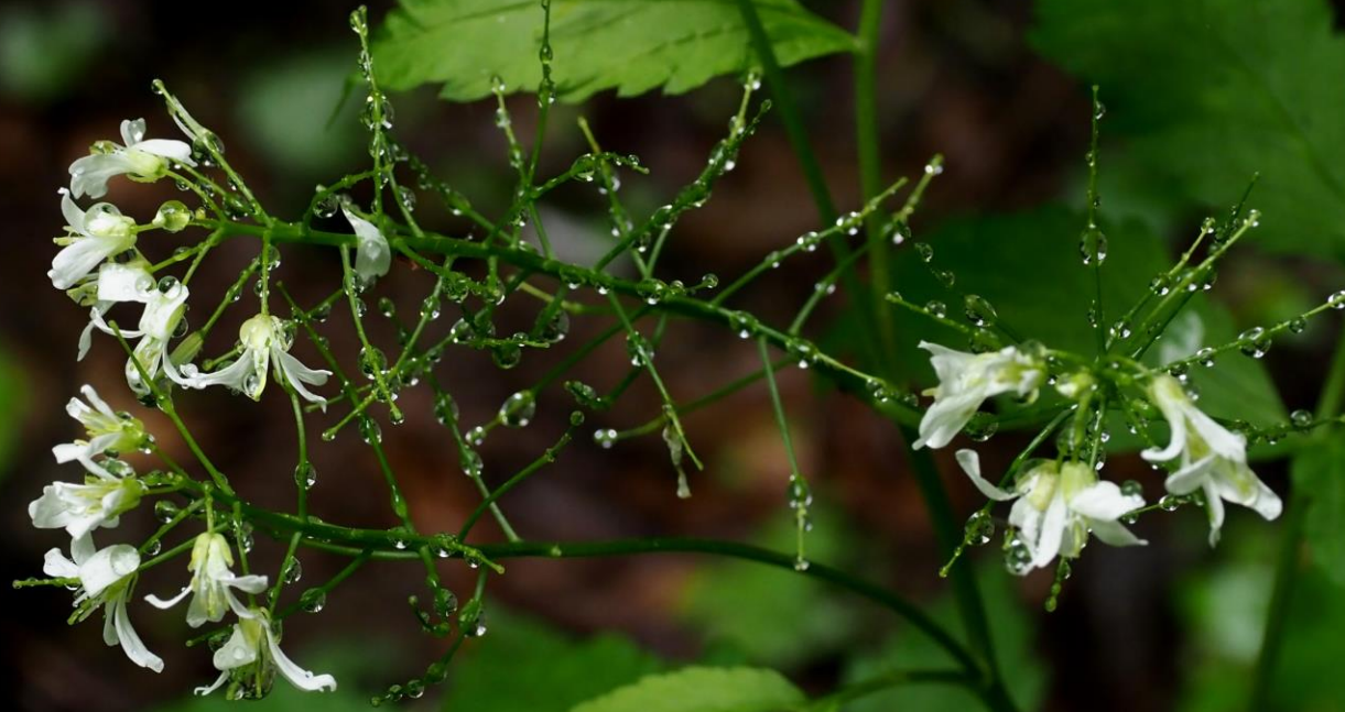
コンロンソウ（崑崙草） アブラナ科