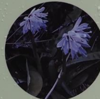
ツクシショウジョウバカマ