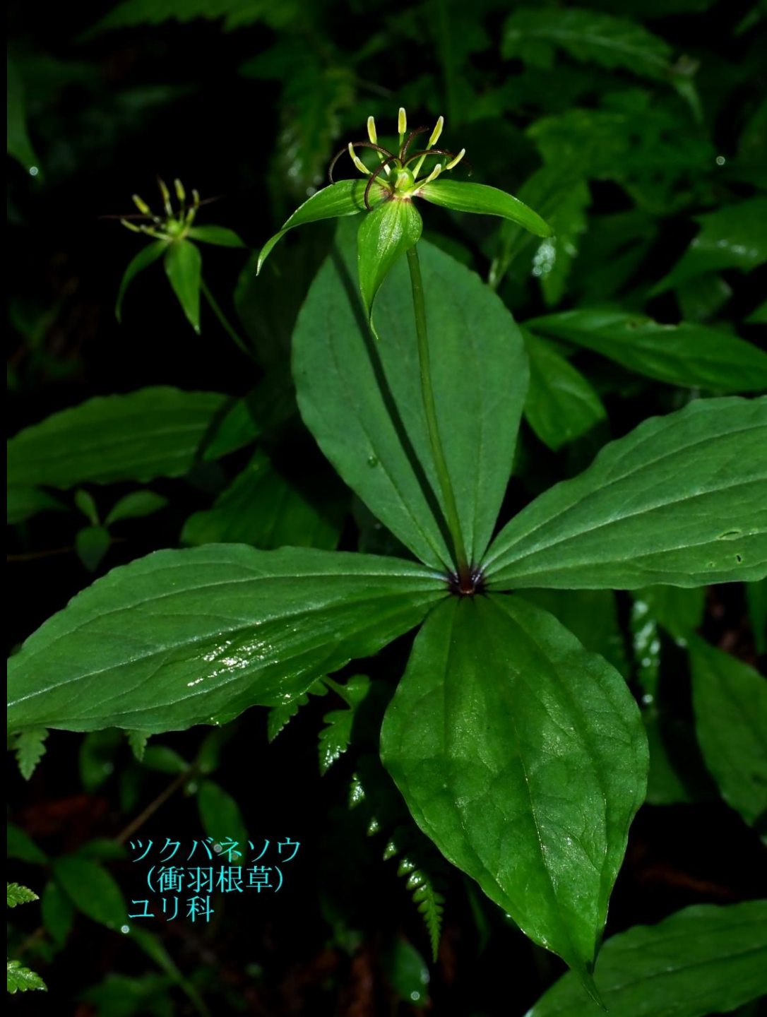
ツクバネソウ (衝羽根草) ユリ科