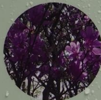
コバノミツバツツジ