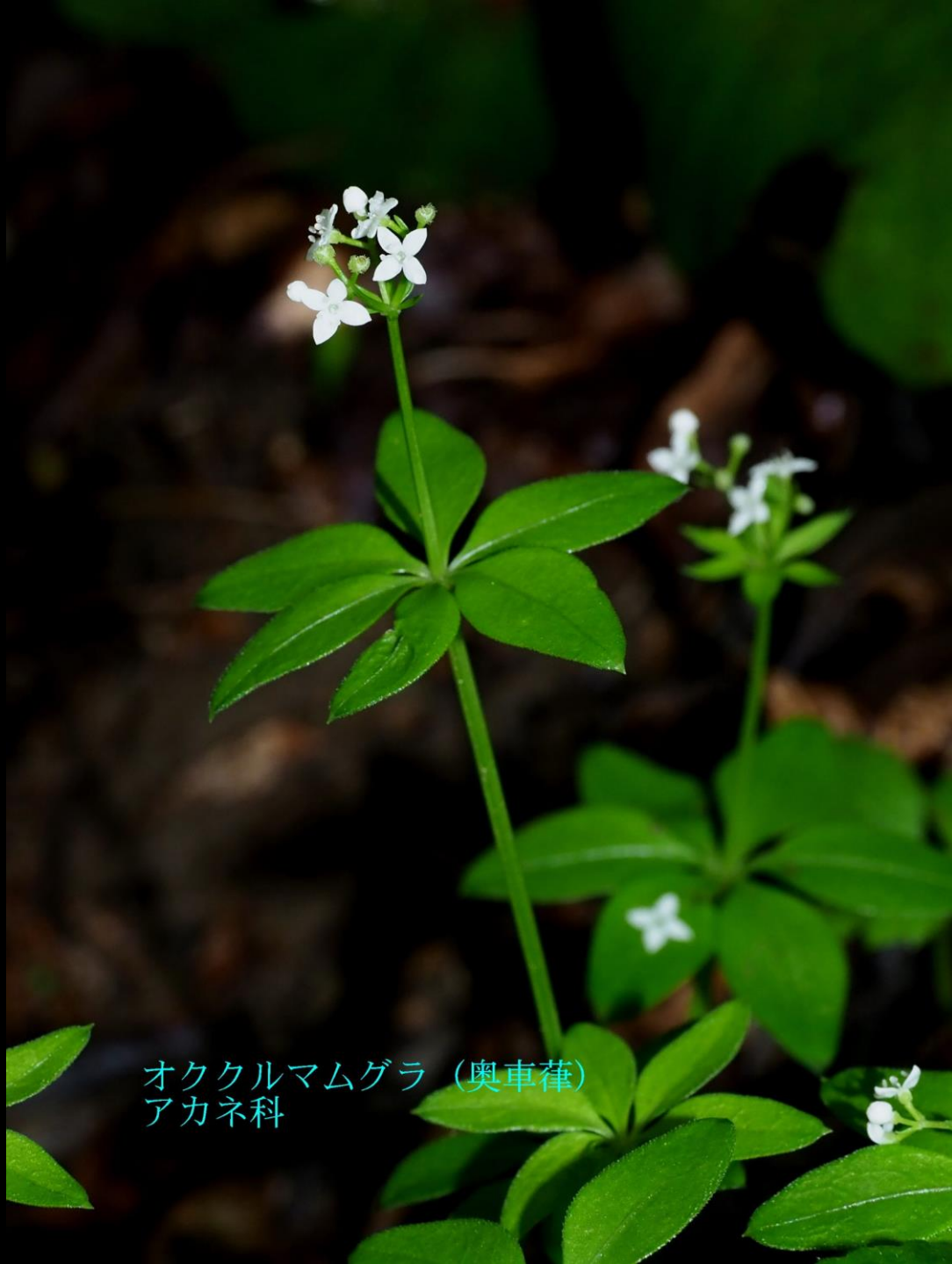
オククルマムグラ (奥車葎) アカネ科