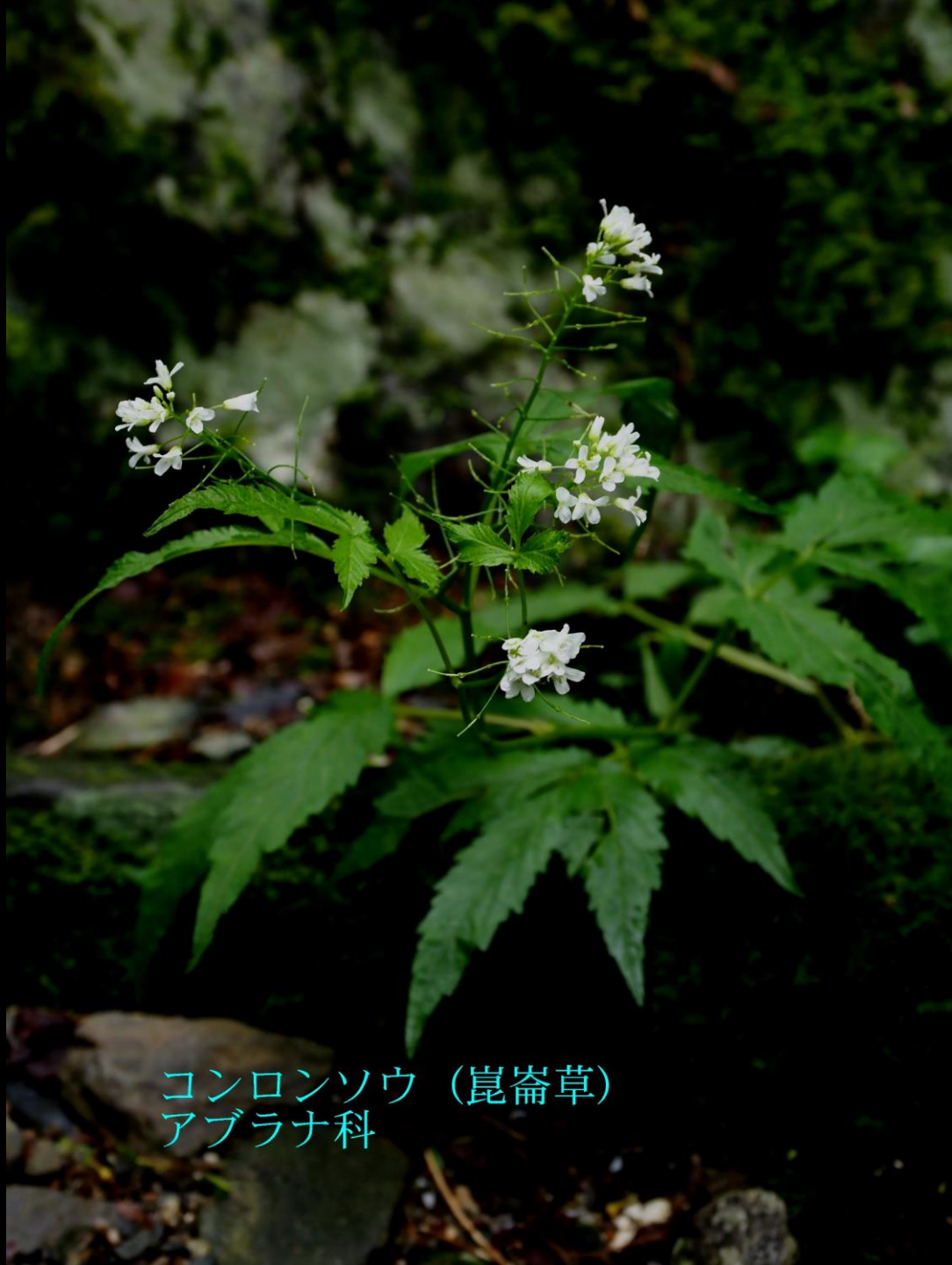
コンロンソウ（崑崙草） アブラナ科