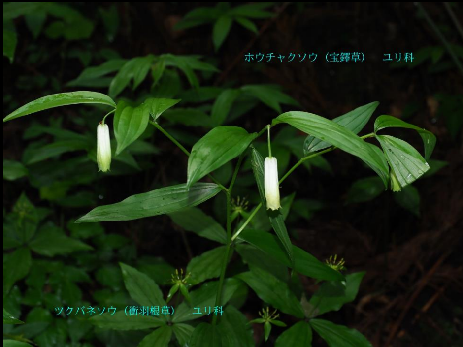
ホウチャクソウ (宝鐸草) ユリ科