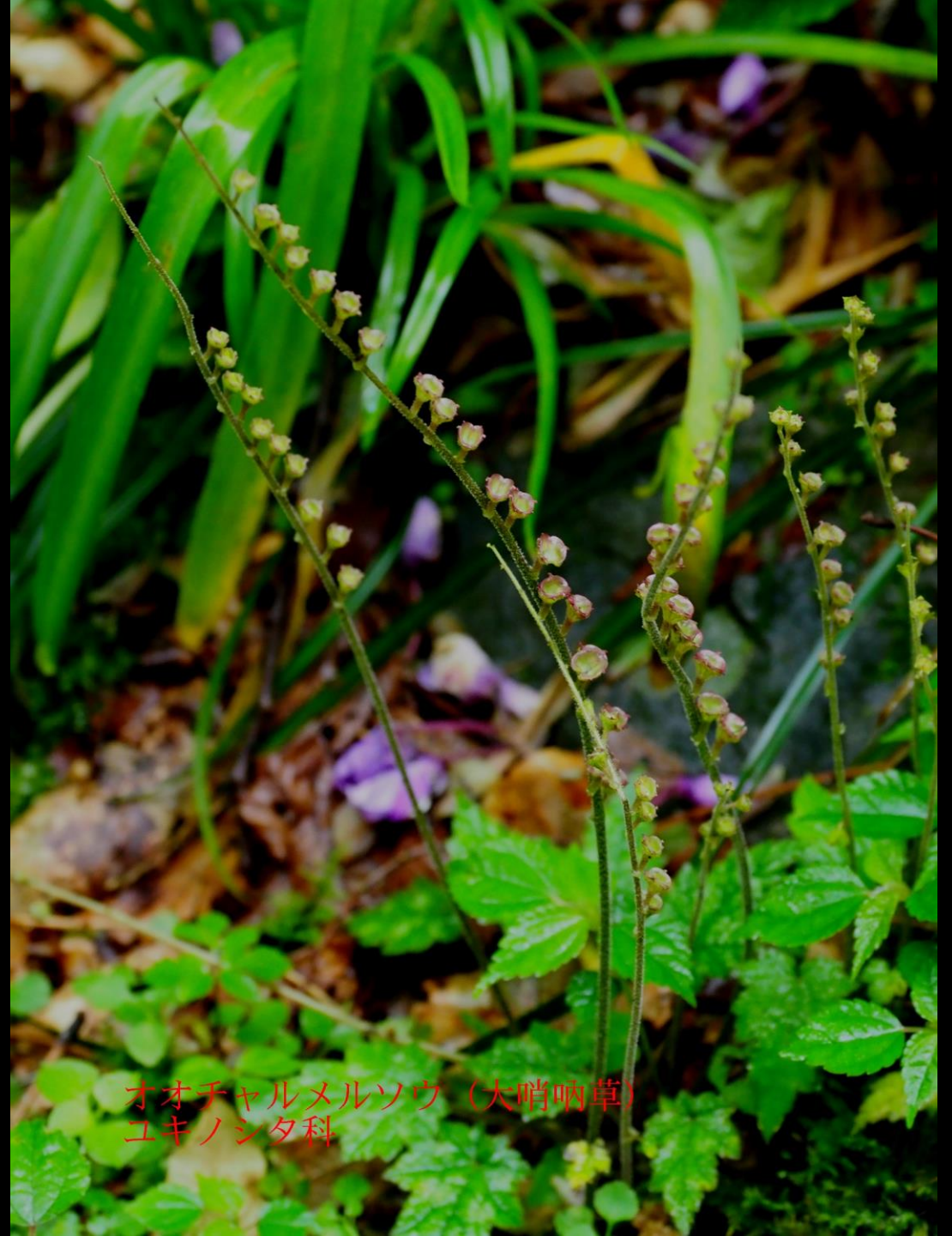
オオチャルメルソウ (大哨唎草) ユキノシタ科