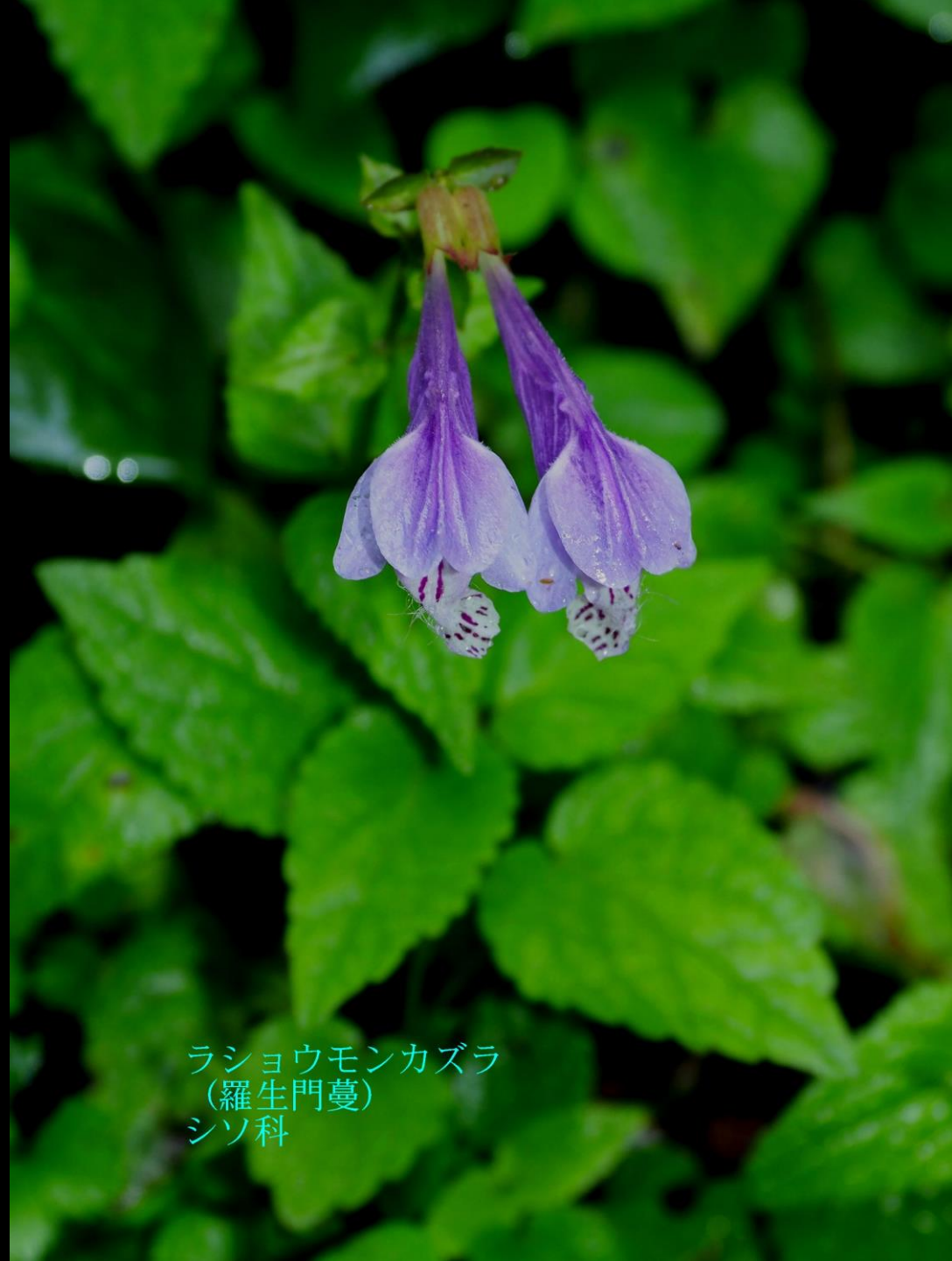
ラショウモンカズラ (羅生門蔓) シソ科