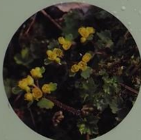
コガネネコノメソウ