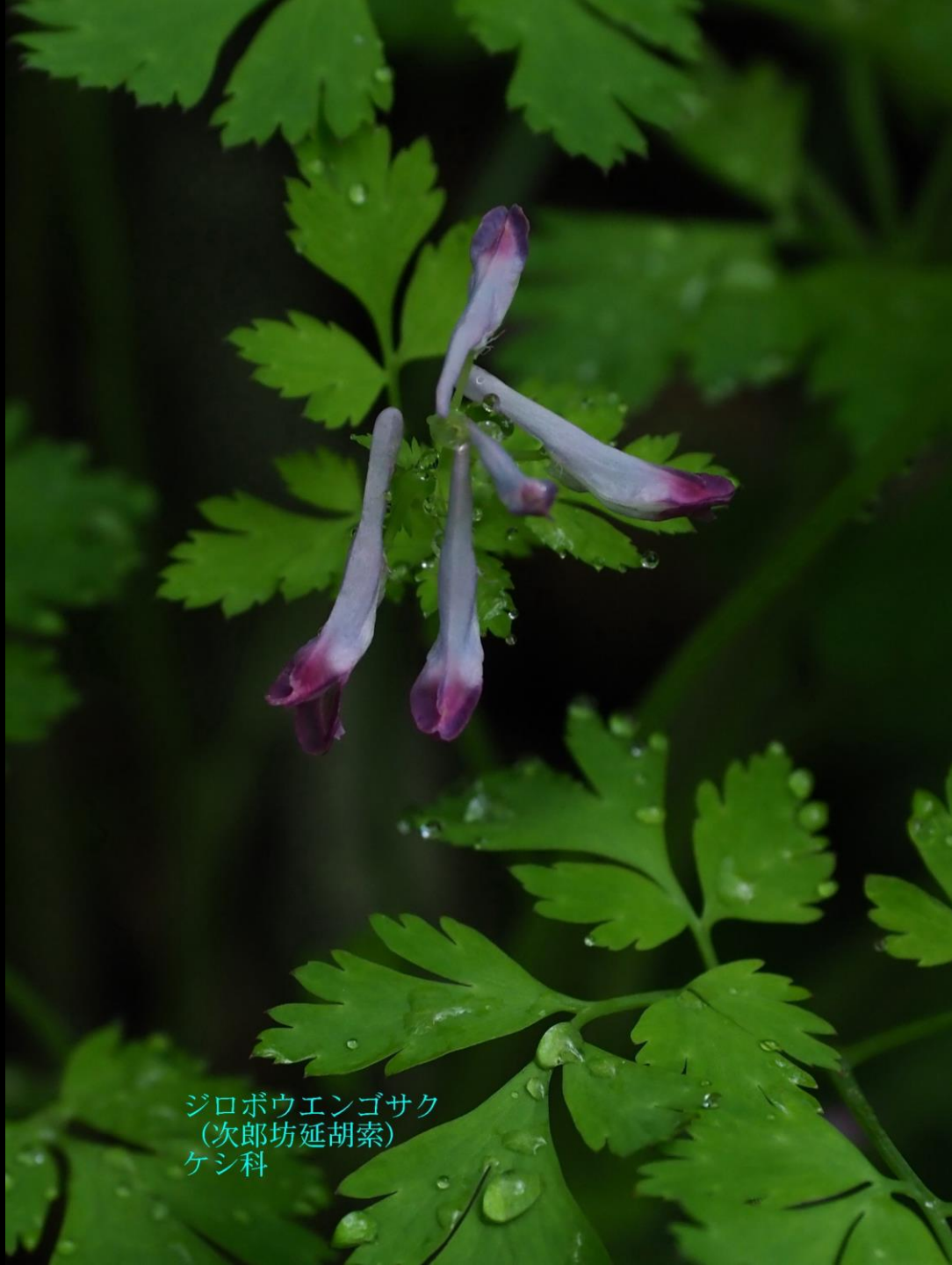
ジロボウエンゴサク (次郎坊延胡索) ケシ科