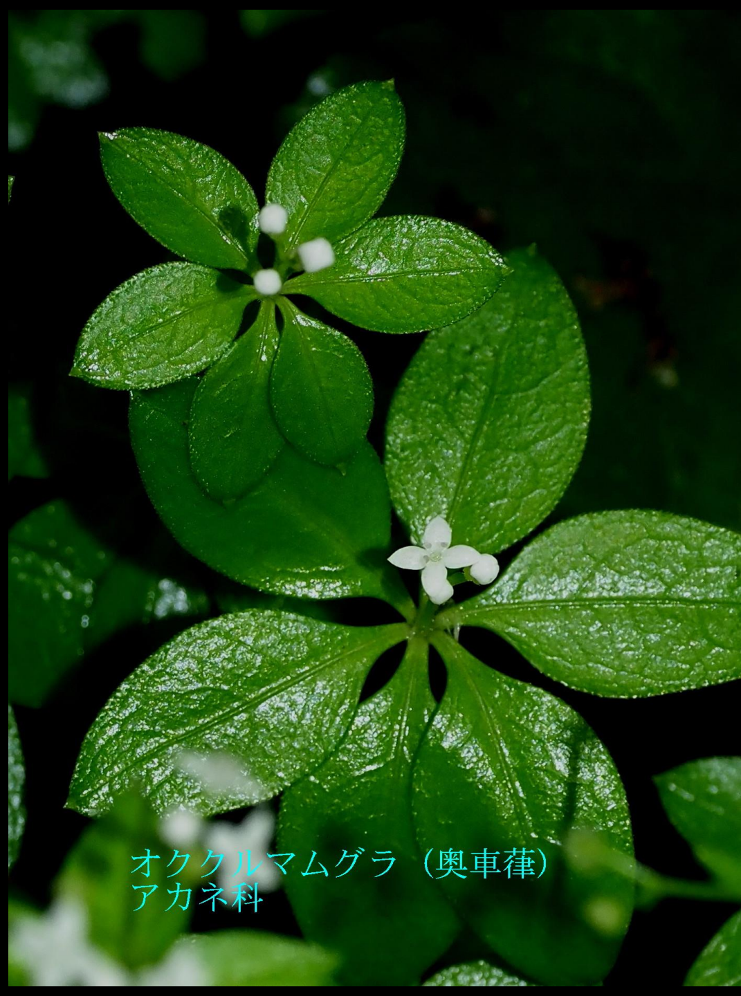
オククルマムグラ (奥車葎) アカネ科