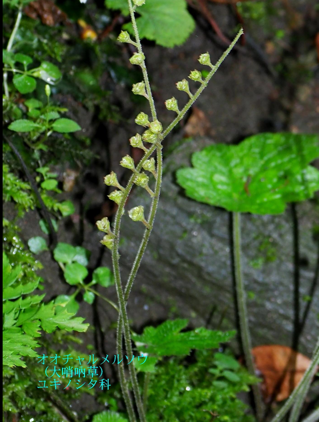
オオチャルメルソウ (大哨唎草) ユキノシタ科