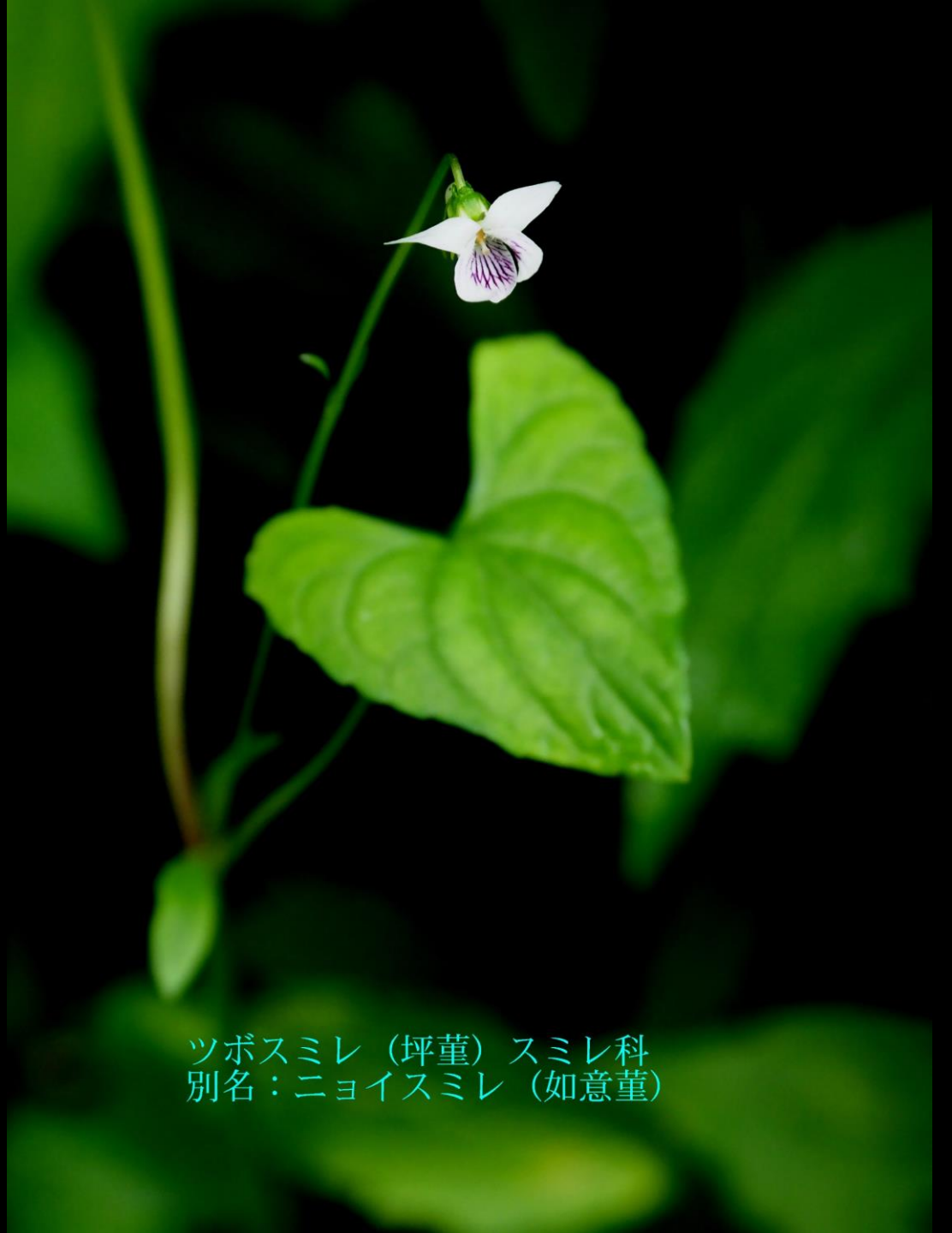
ツボスミレ（坪堇） スミレ科 別名：ニョイスミレ（如意堇）