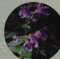
ラショウモンカズラ