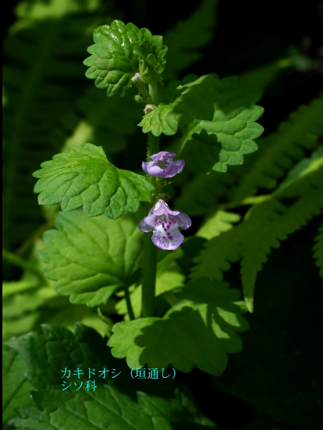
カキドオシ (垣通し) シソ科