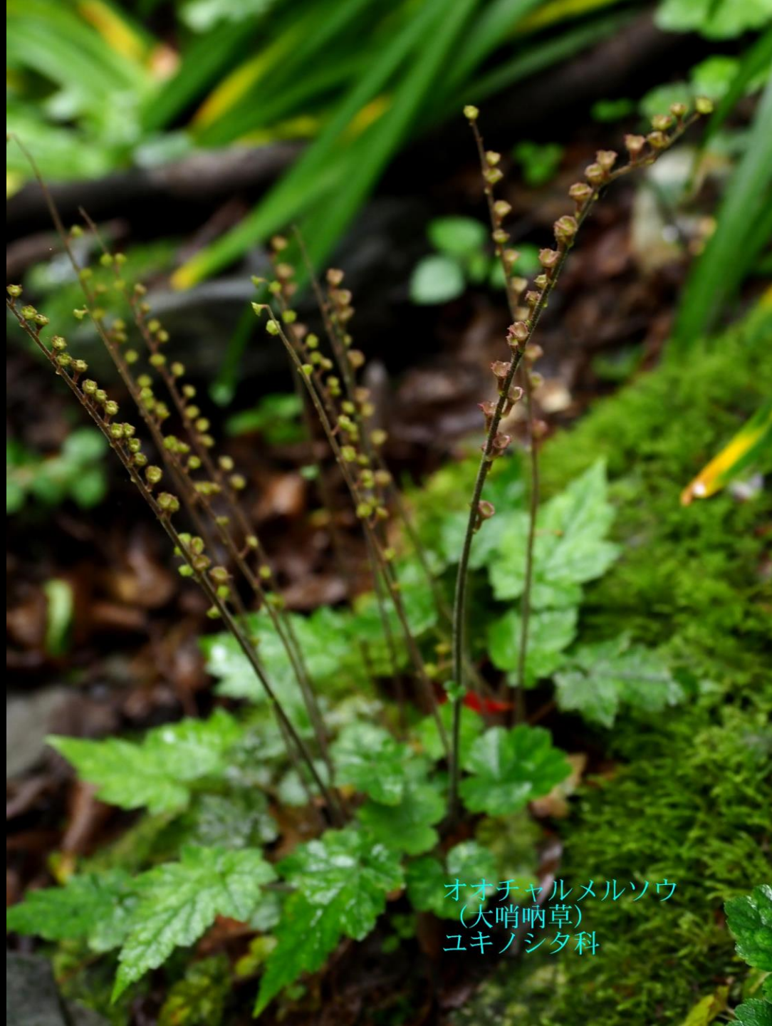
オオチャルメルソウ (大哨唎草) ユキノシタ科