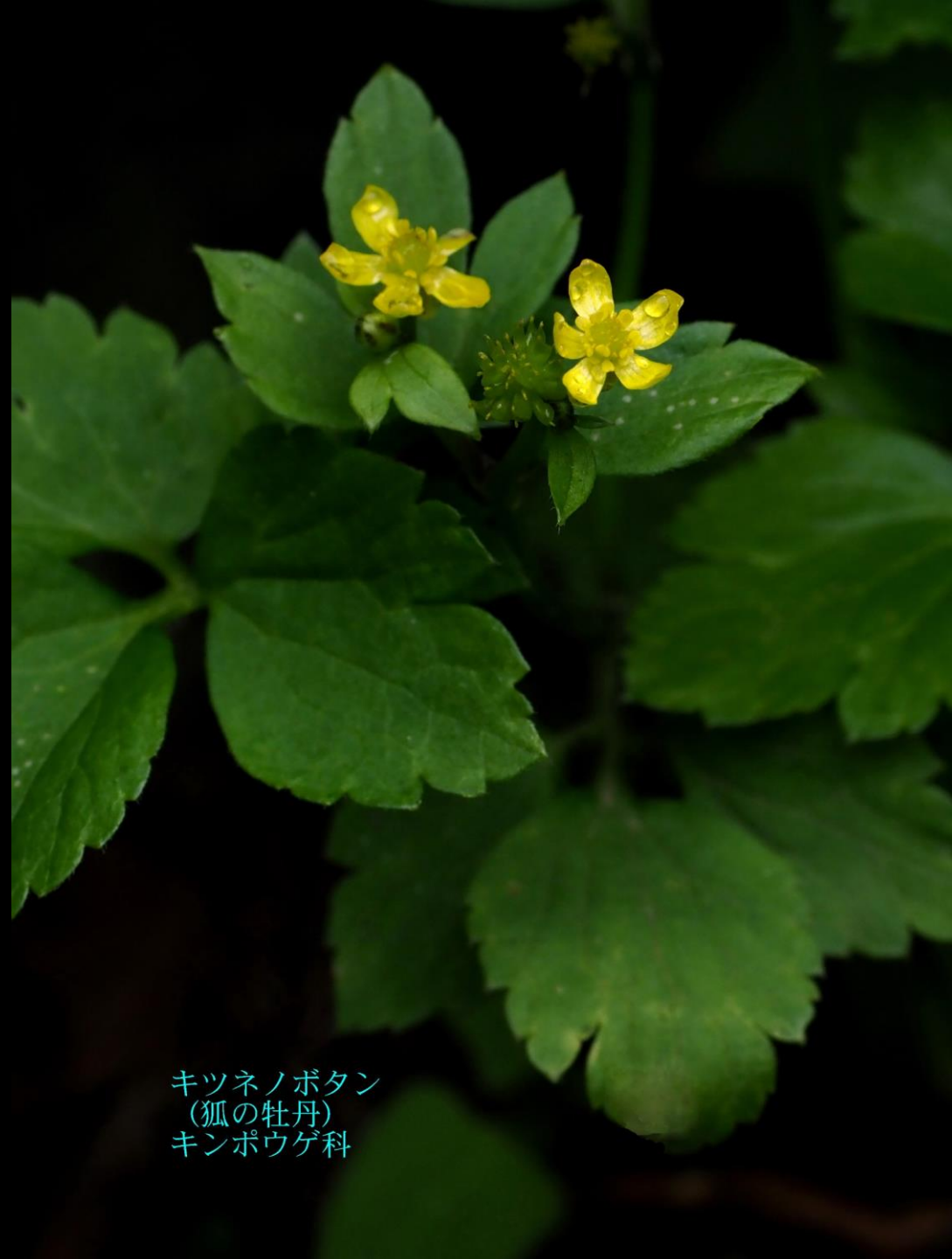
キツネノボタン (狐の牡丹) キンポウゲ科