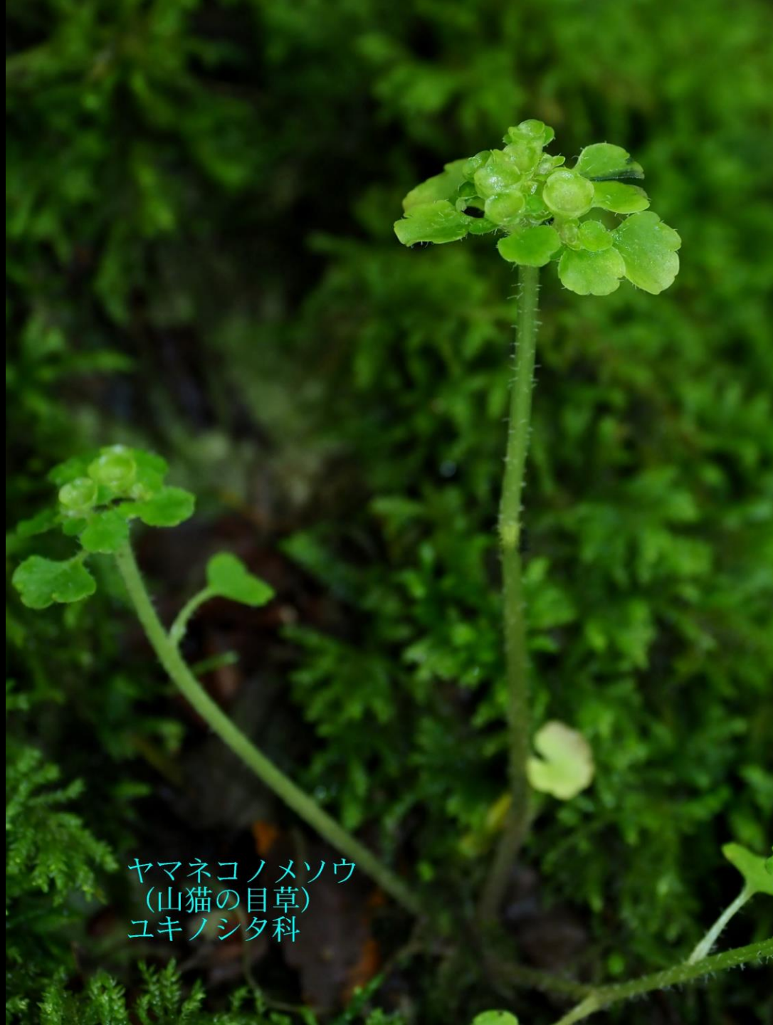
ヤマネコノメソウ (山猫の目草) ユキノシタ科