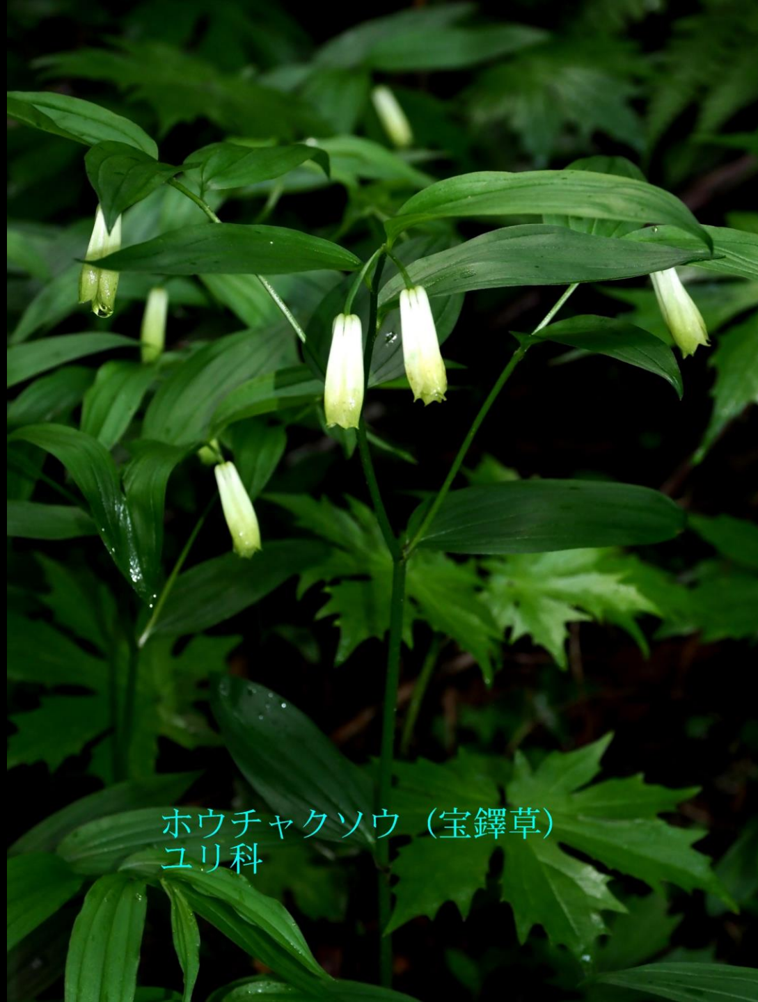
ホウチャクソウ (宝鐸草) ユリ科