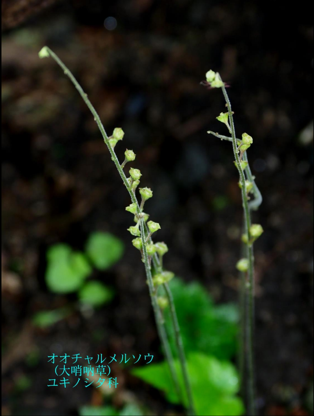
オオチャルメルソウ (大哨唎草) ユキノシタ科