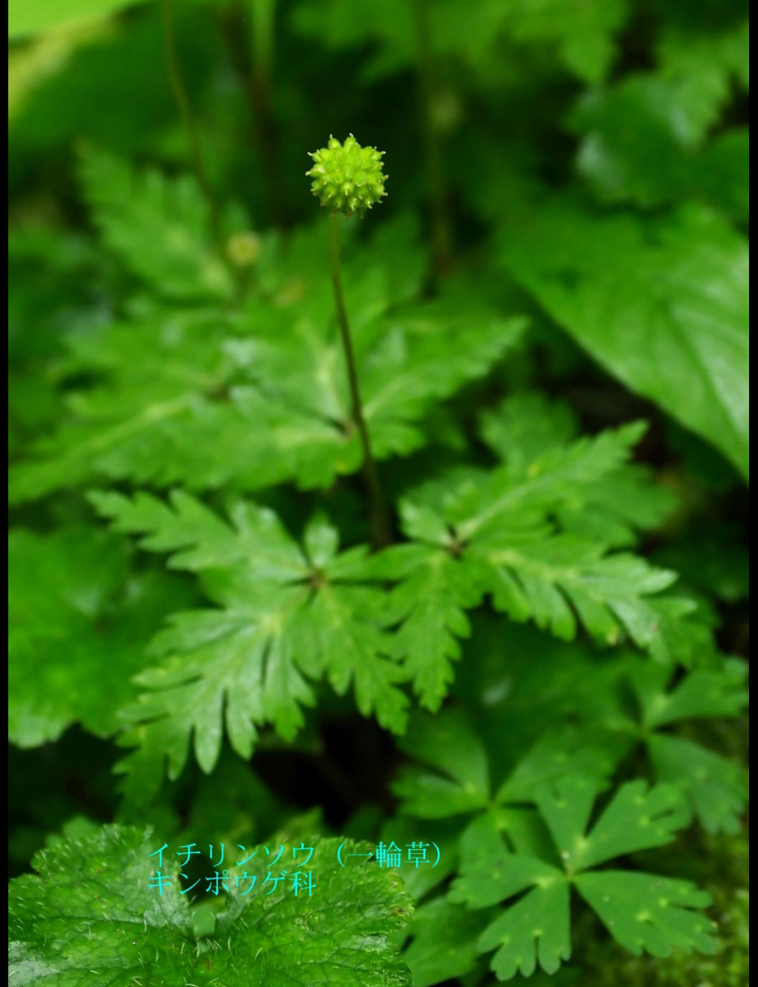
イチリンソウ (一輪草) キンポウゲ科