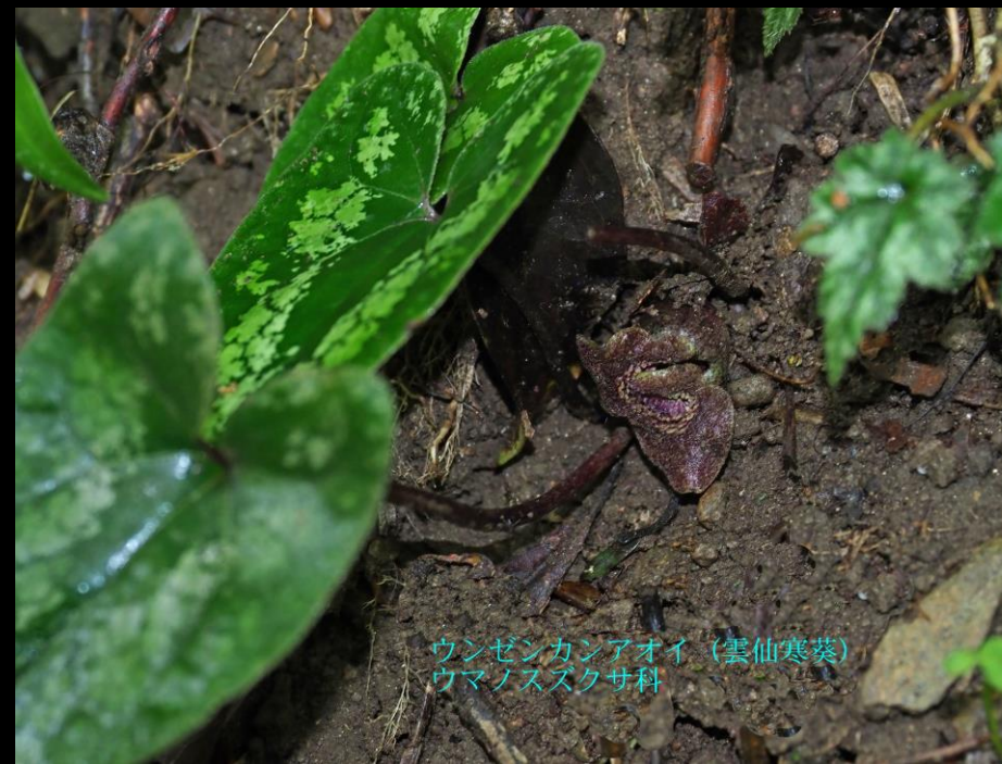
ウンゼンカンアオイ (雲仙寒葵) ウマノスズクサ科