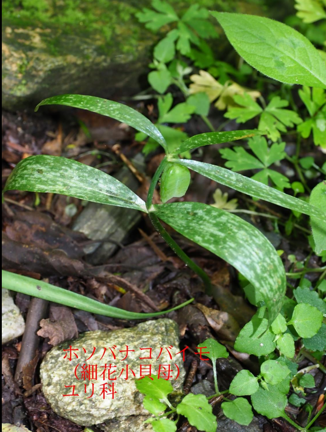
ホソバナコバイモ (細花小貝母) ユリ科