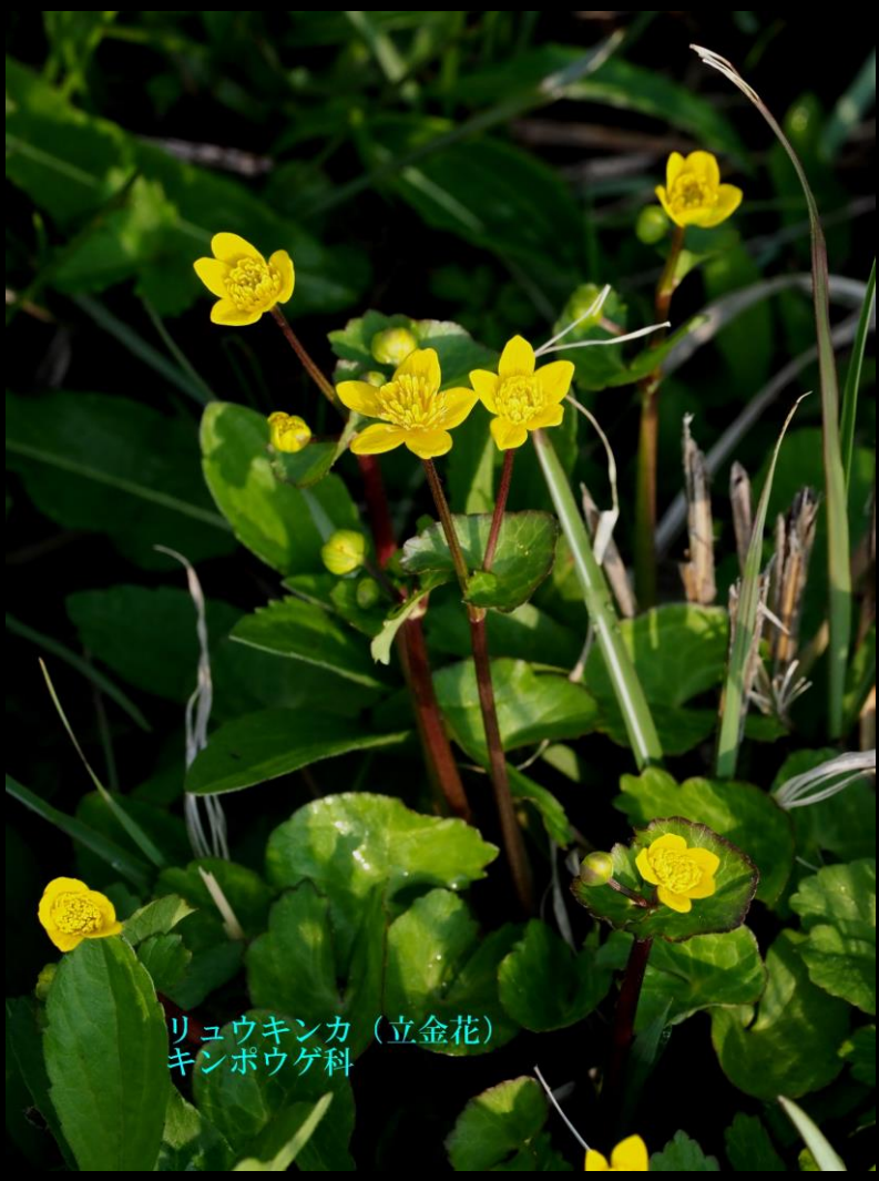
リュウキンカ（立金花） キンポウゲ科