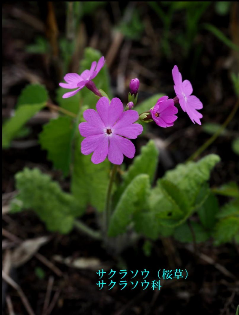
サクラソウ（桜草） サクラソウ科