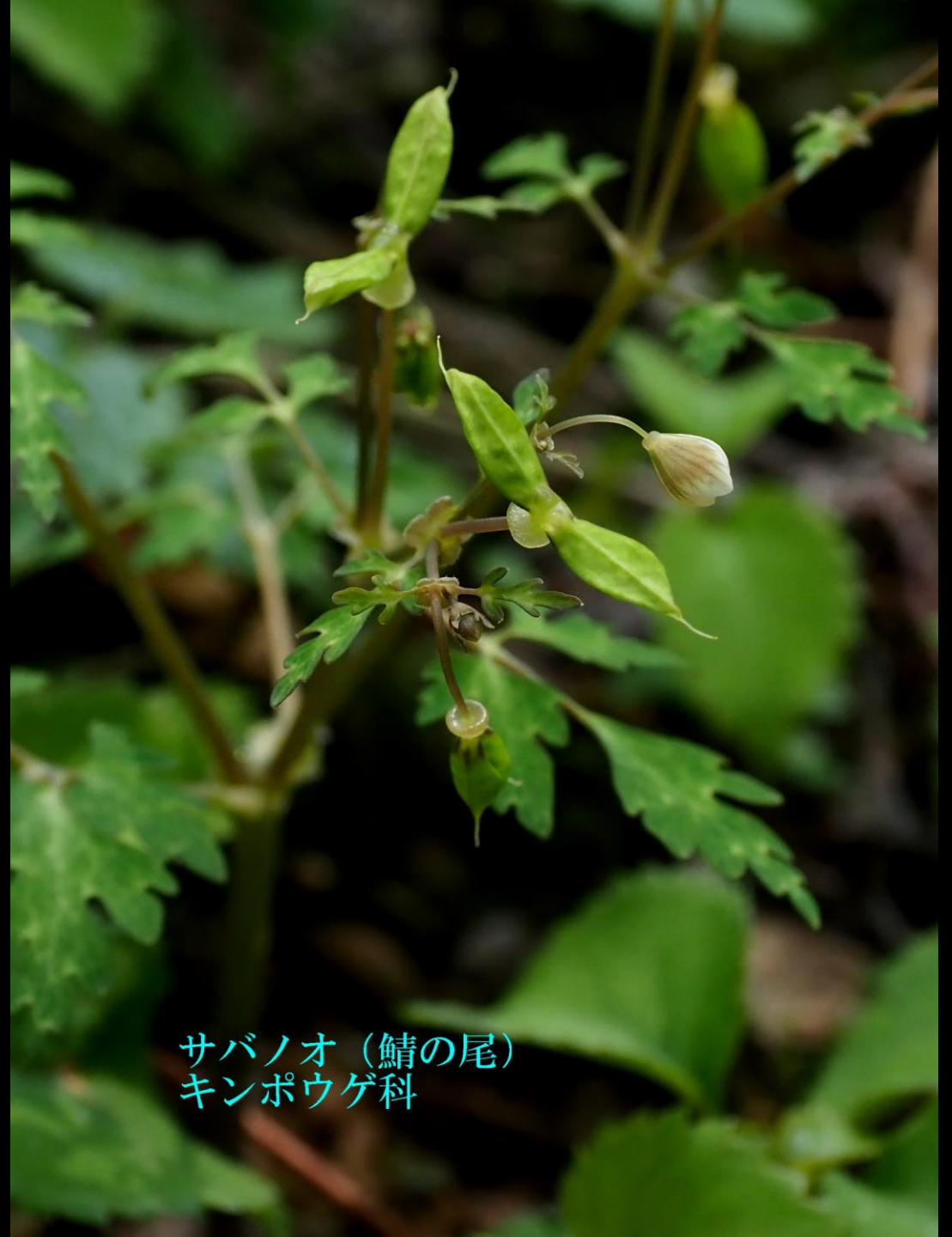
サバノオ (鯖の尾) キンポウゲ科