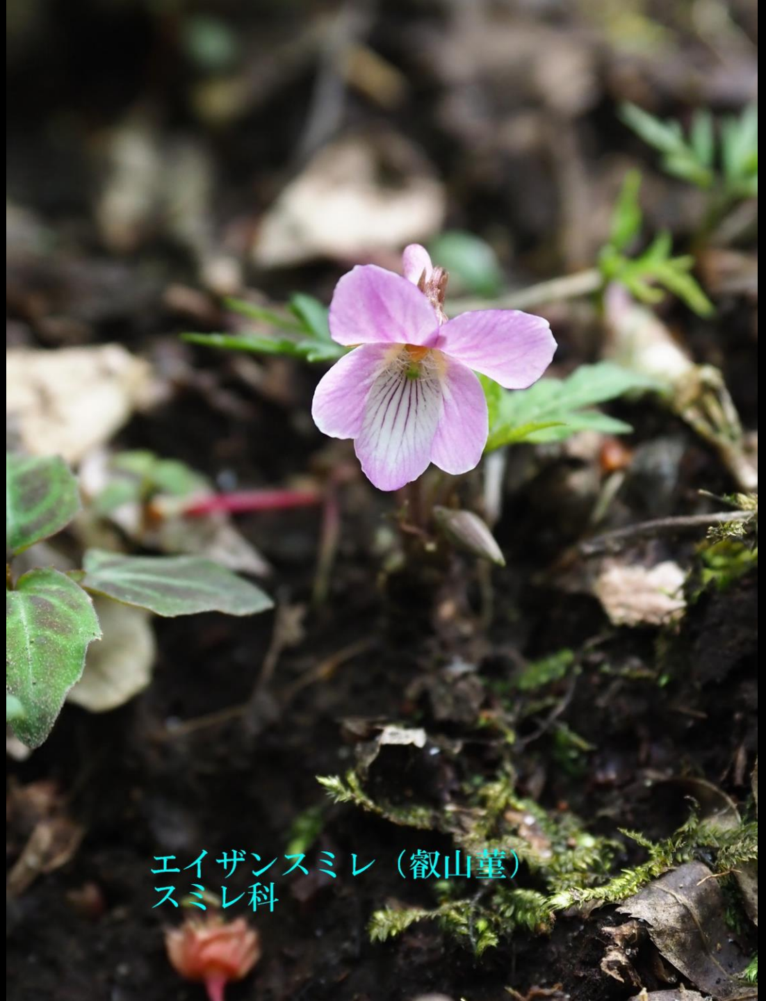
アイザンスミレ (叡山堇) スミレ科