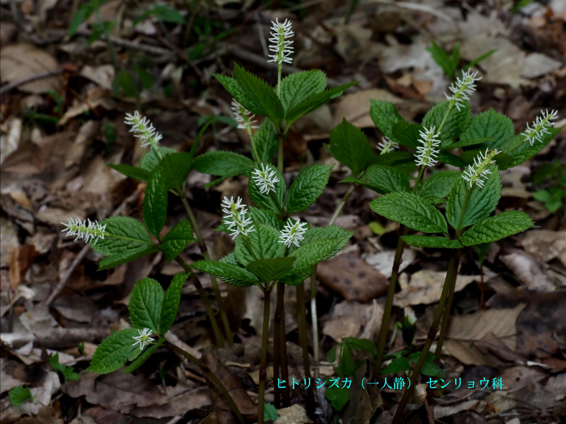
ヒトリシズカ（一人静） センリョウ科