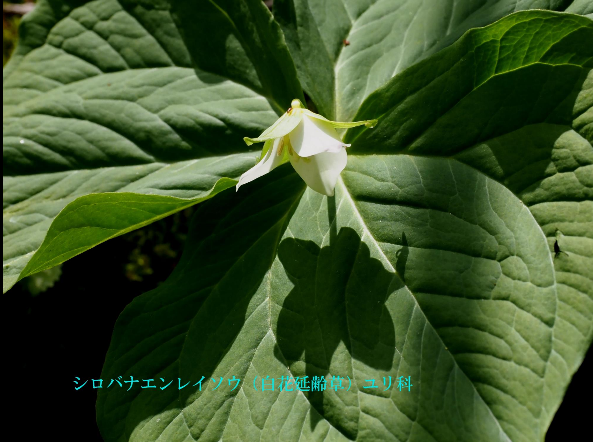
シロバナエンレイソウ（白花延齡草）ユリ科