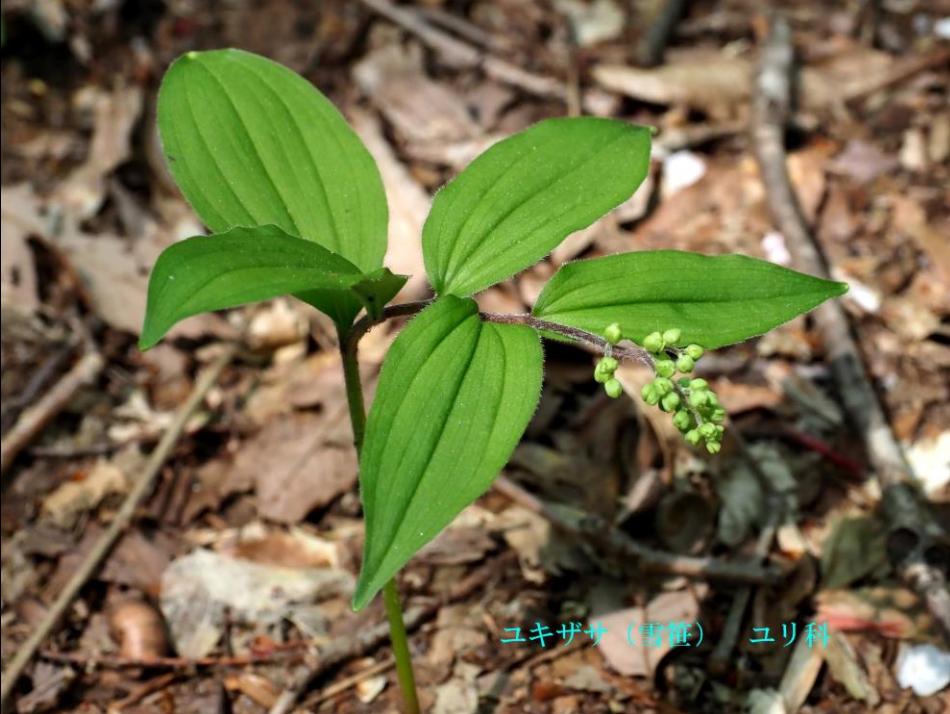
ユキザサ (雪笹) ユリ科