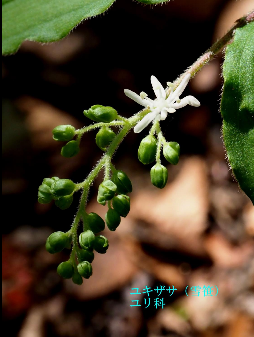
ユキザサ (雪笹) ユリ科