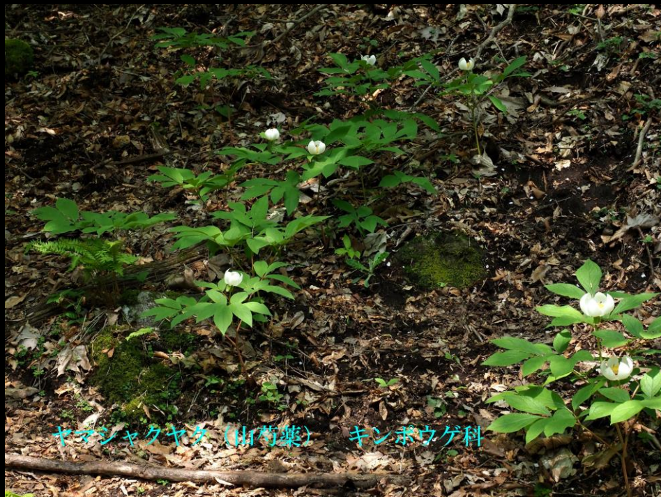
ヤマシャクヤク (山芍薬) キンポウゲ科