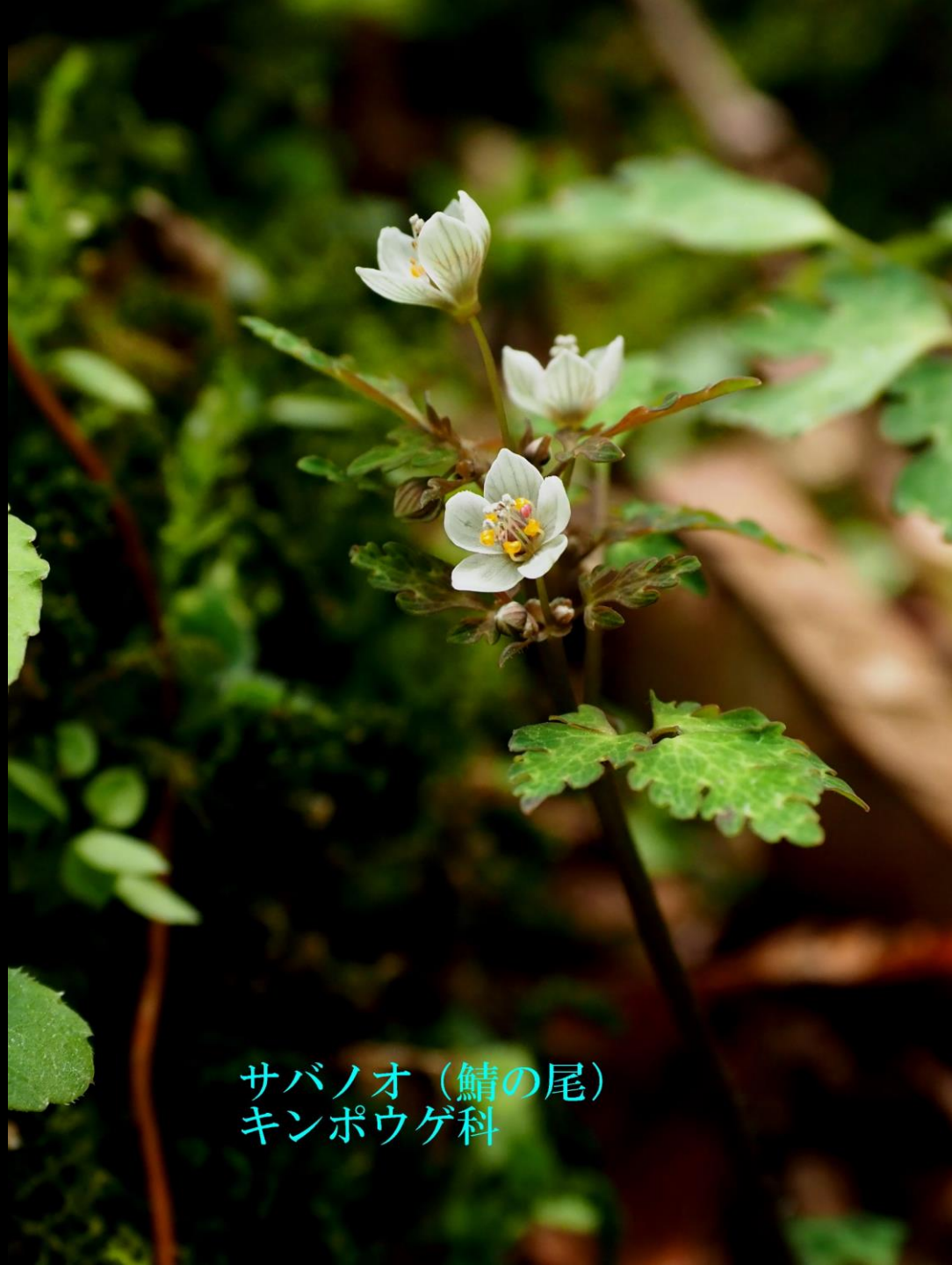
サバノオ (鯖の尾) キンポウゲ科