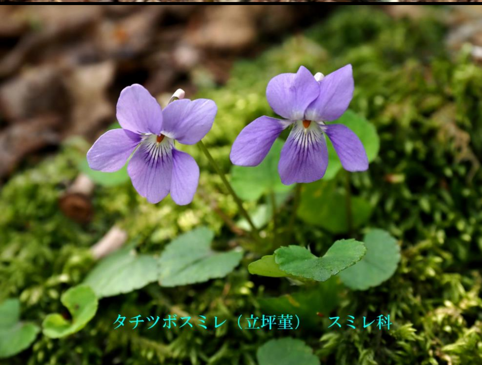
タチツボスミレ (立坪堇) スミレ科