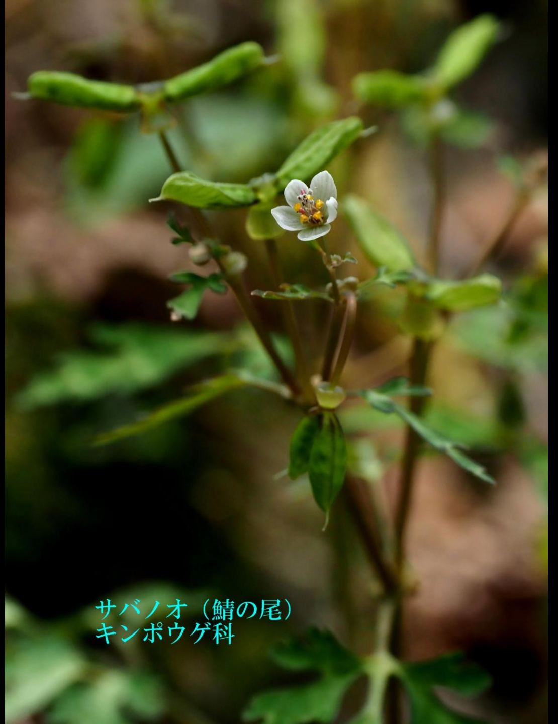
サバノオ (鯖の尾) キンポウゲ科