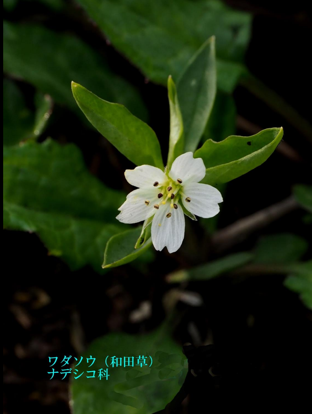
ワダソウ (和田草) ナデシコ科