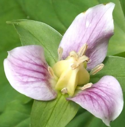
シロバナエンレイソウ（白花延齡草）ユリ科