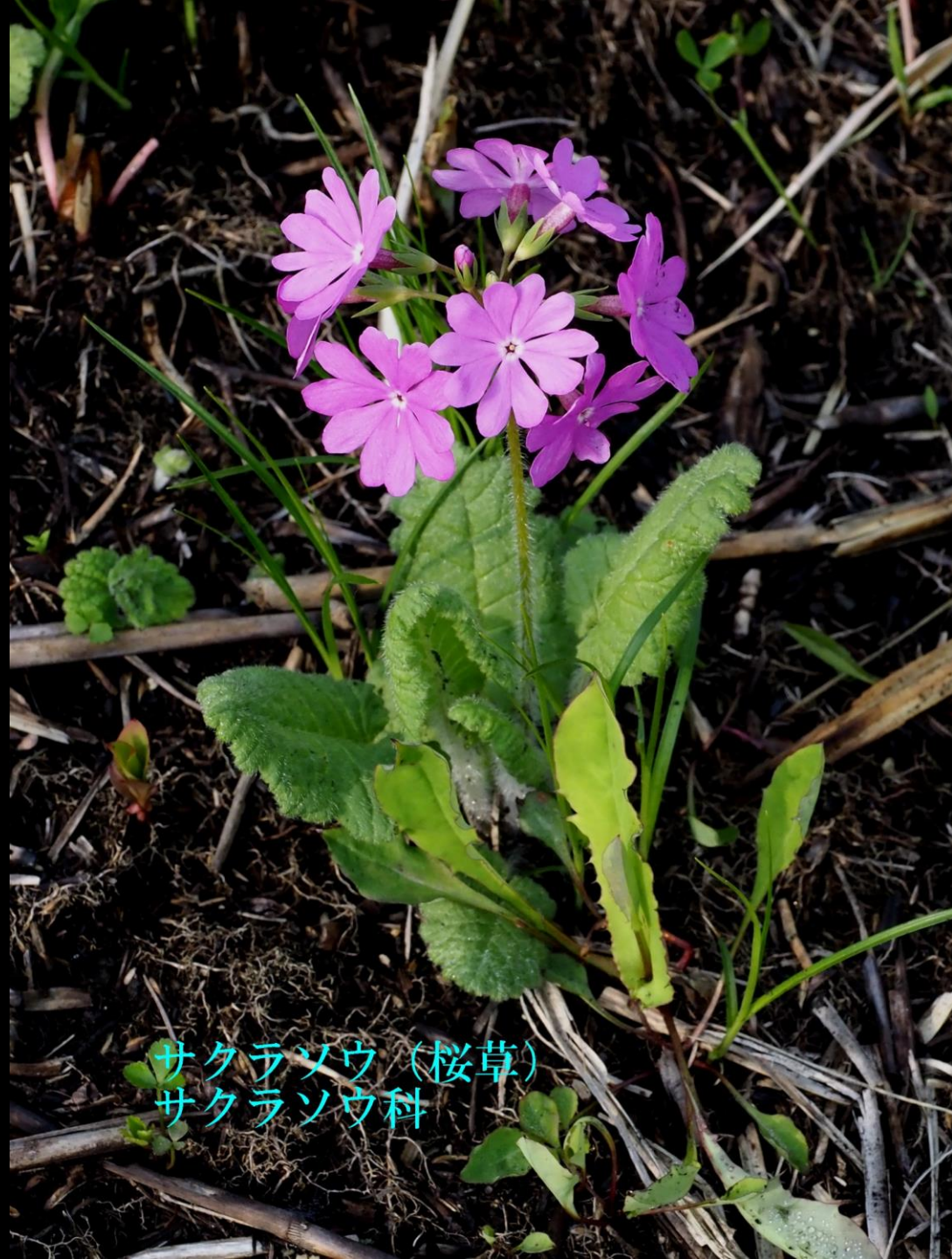
サクラソウ (桜草) サクラソウ科