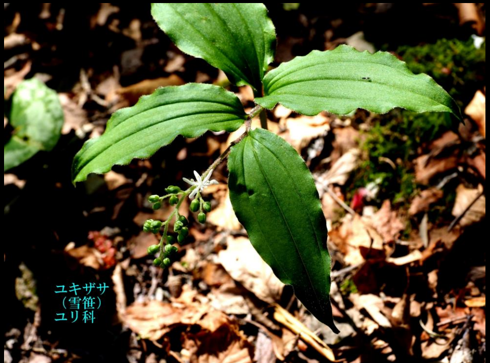
ユキザサ (雪笹) ユリ科