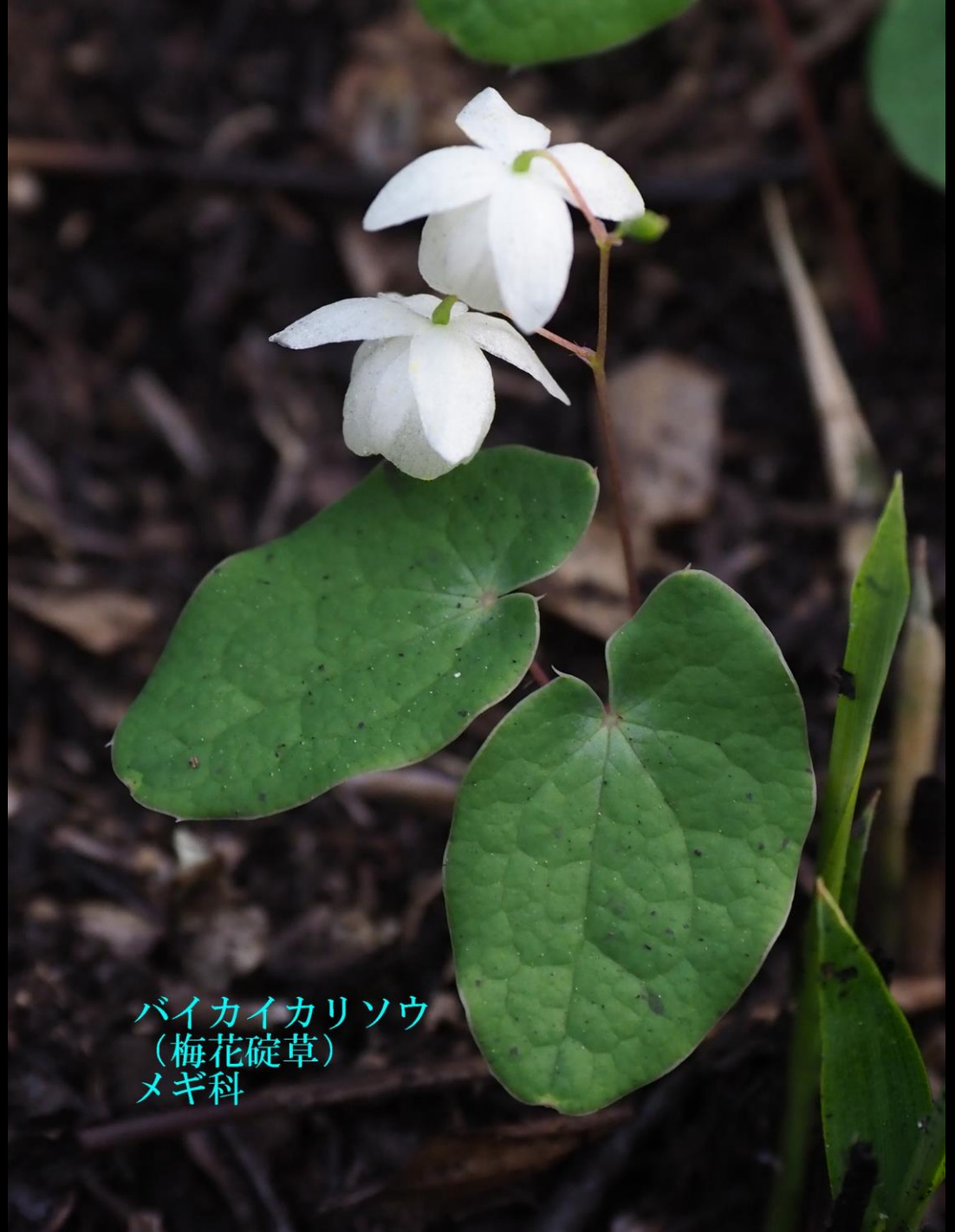
バイカイカリソウ (梅花碓草) メギ科