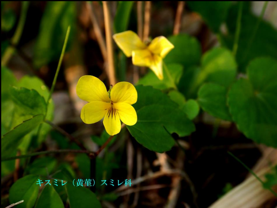
キスミレ (黄堇) スミレ科