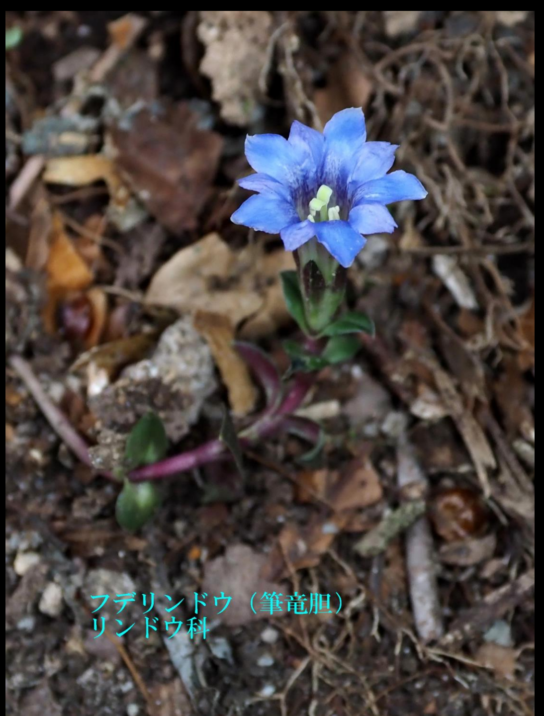
フデリンドウ (筆竜胆) リンドウ科