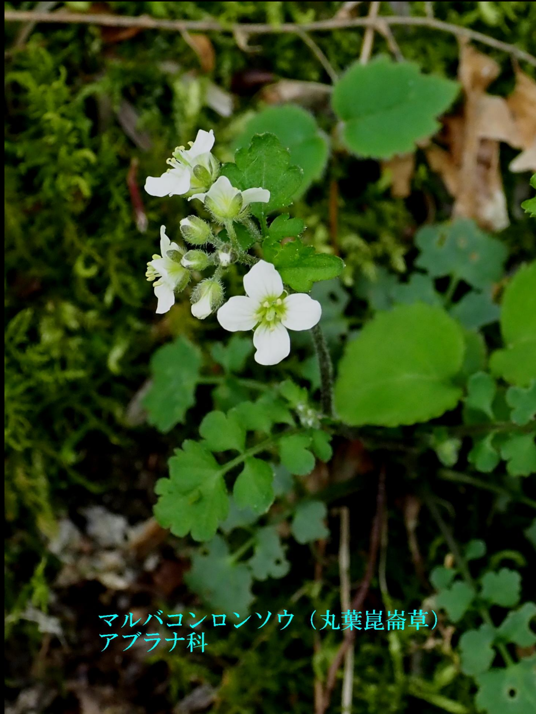
マルバコンロンソウ (丸葉崑崙草) アブラナ科