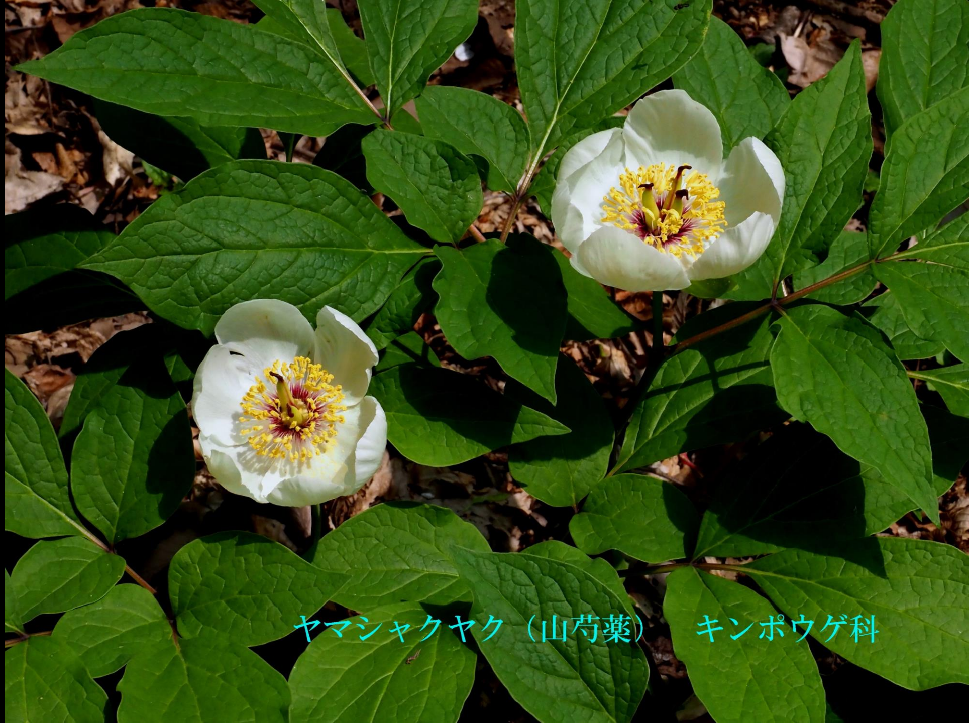
ヤマシャクヤク (山芍薬)