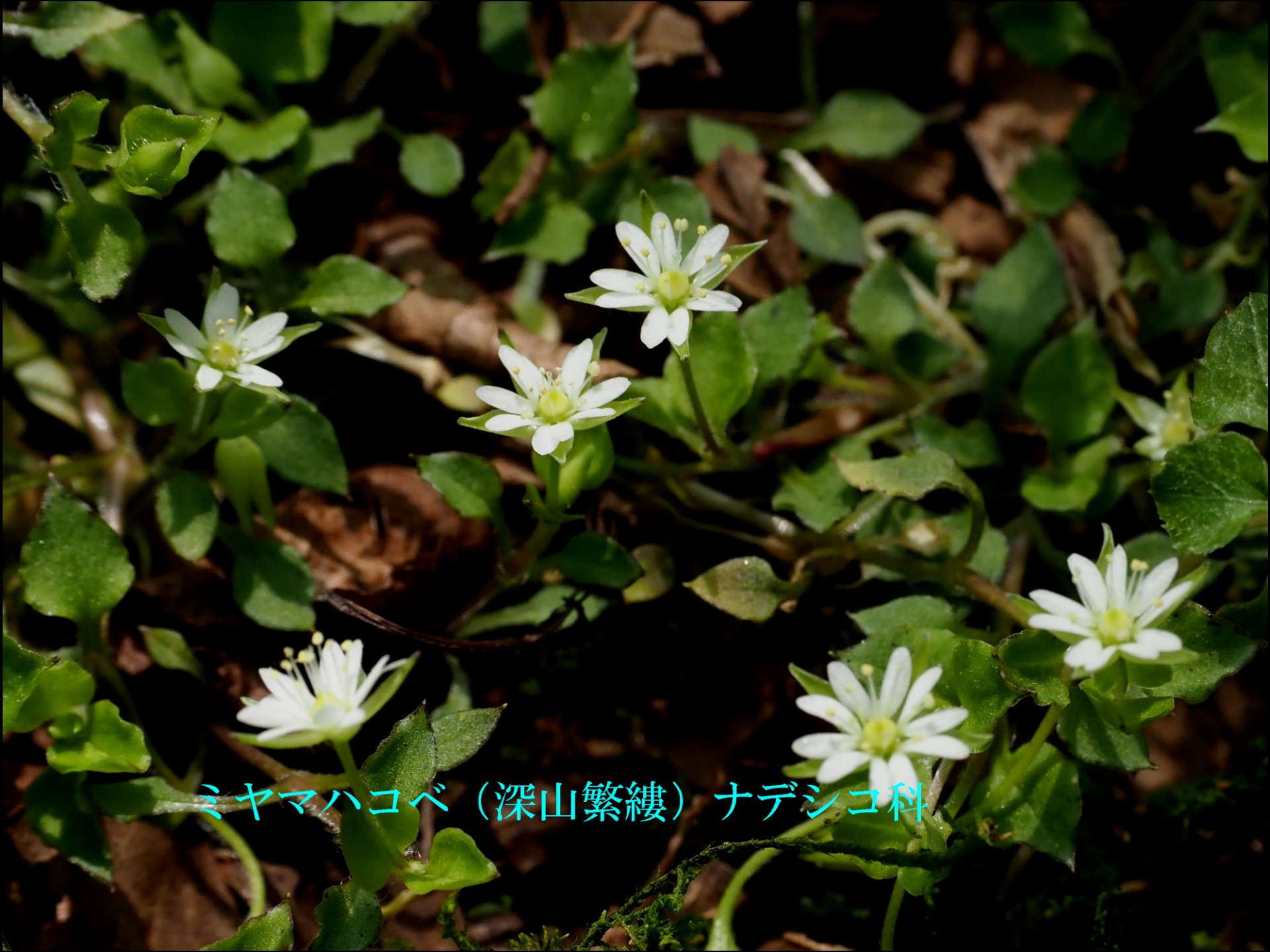
ミヤマハコベ (深山繁縷) ナデシコ科