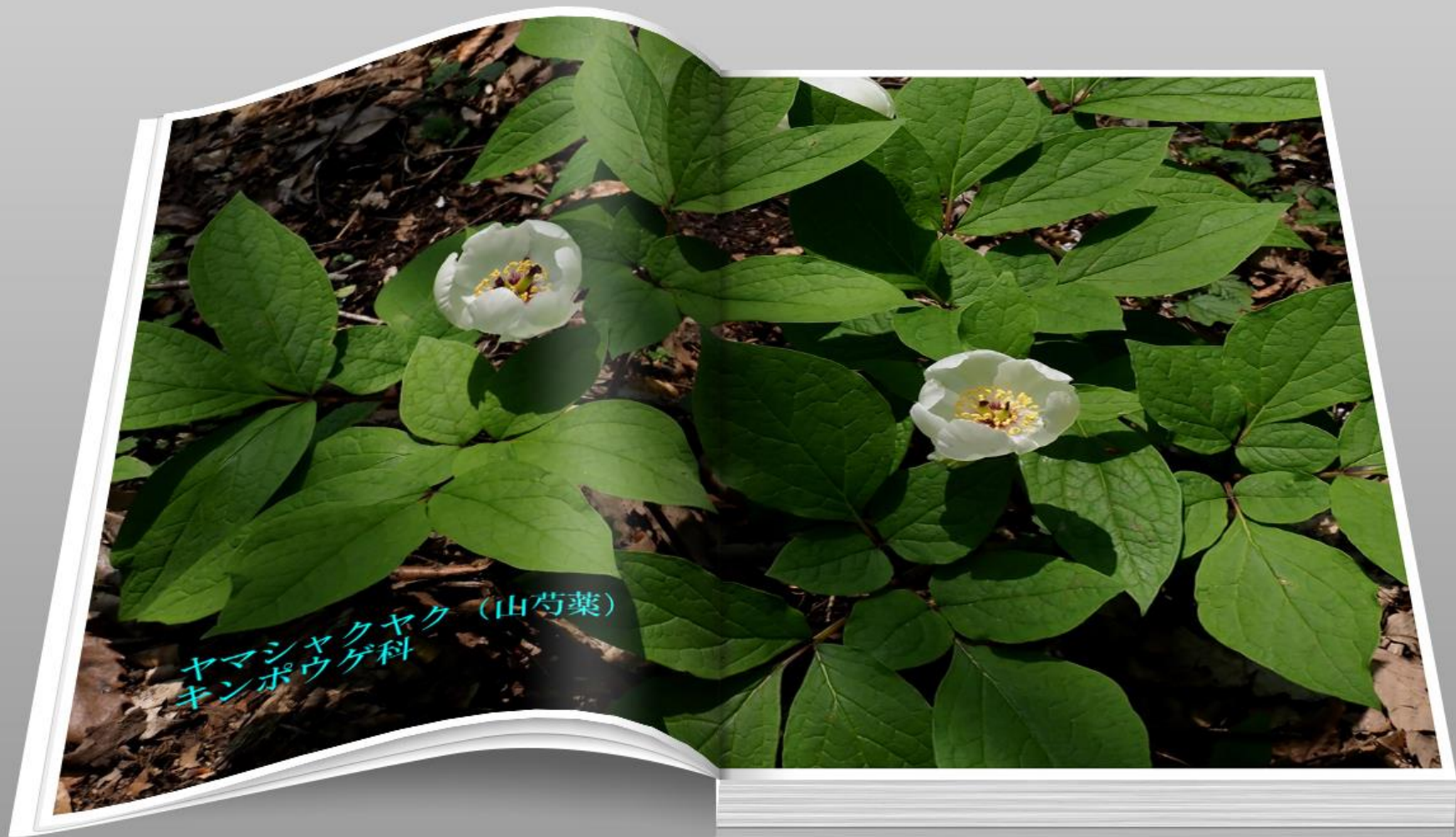
ヤマシヤクヤク (山芍薬) キンポウゲ科