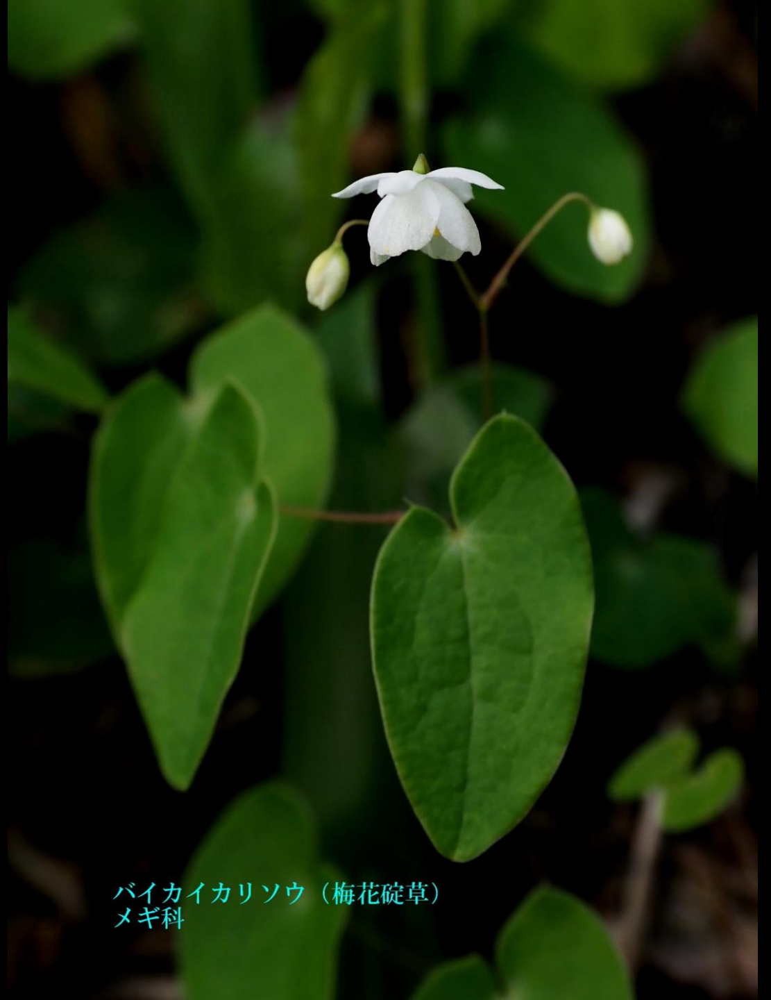
バイカイカリソウ (梅花碇草) メギ科