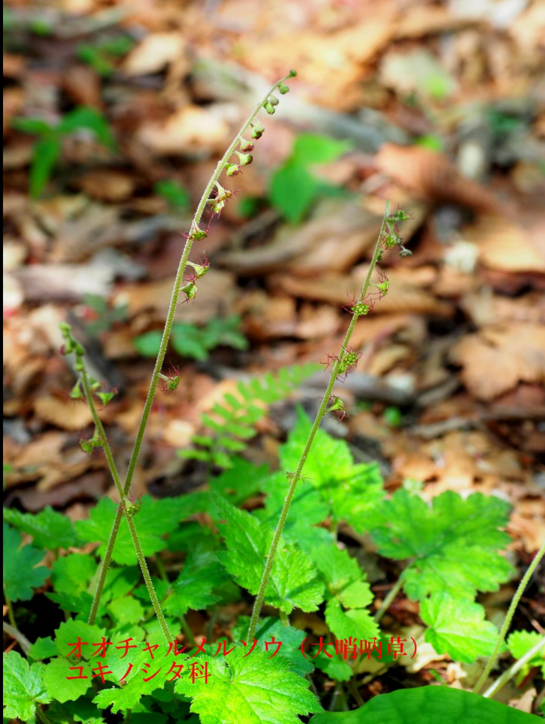
オオチャルメルソウ (大哨唸草) ユキノシタ科