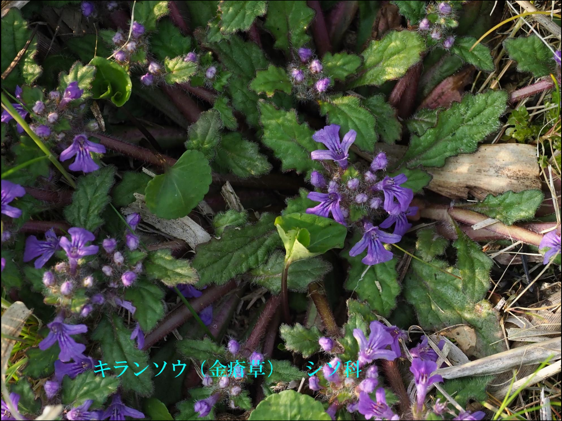
キランソウ (金瘡草) シソ科