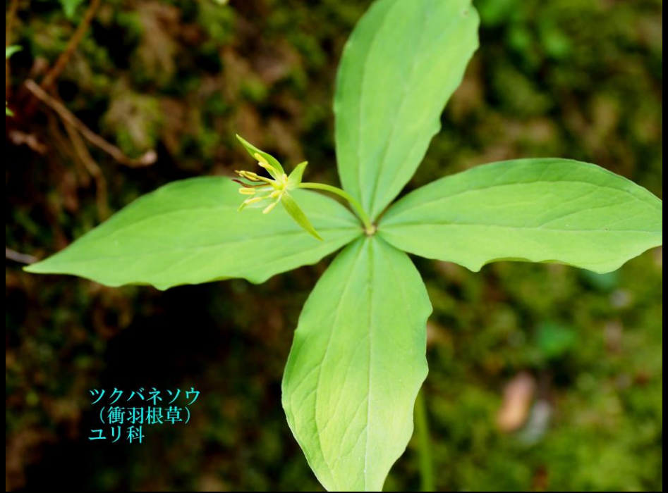
ツクバネソウ (衝羽根草) ユリ科