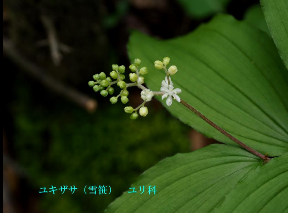
ユキザサ (雪笹) ユリ科