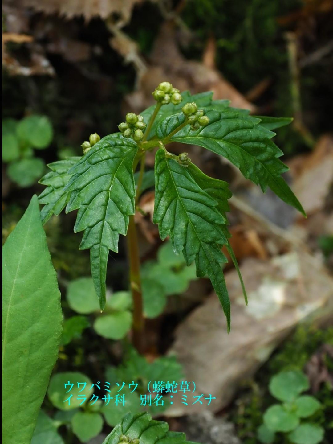
ウワバミソウ (蟒蛇草) イラクサ科 別名: ミズナ