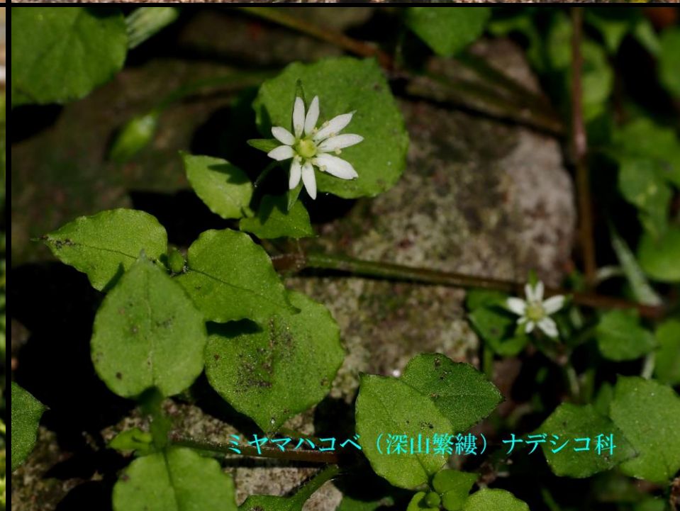
ミヤマハコベ (深山繁縷) ナデシコ科