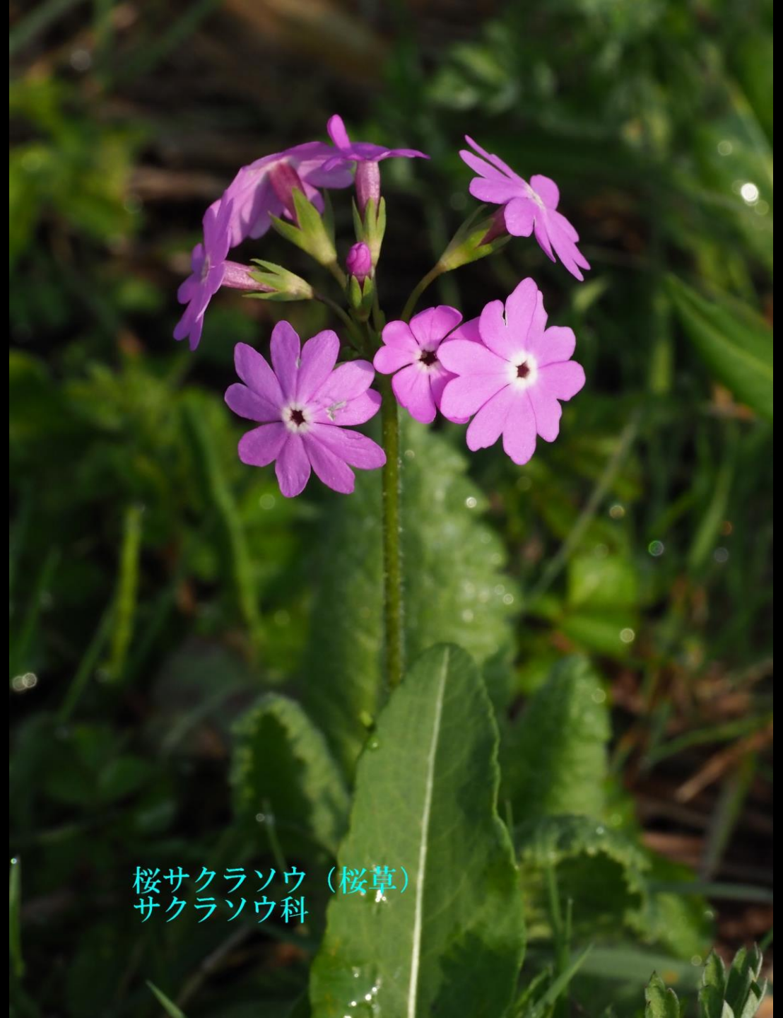
桜サクラソウ (桜草) サクラソウ科