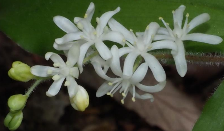
ユキザサ (雪笹) ユリ科