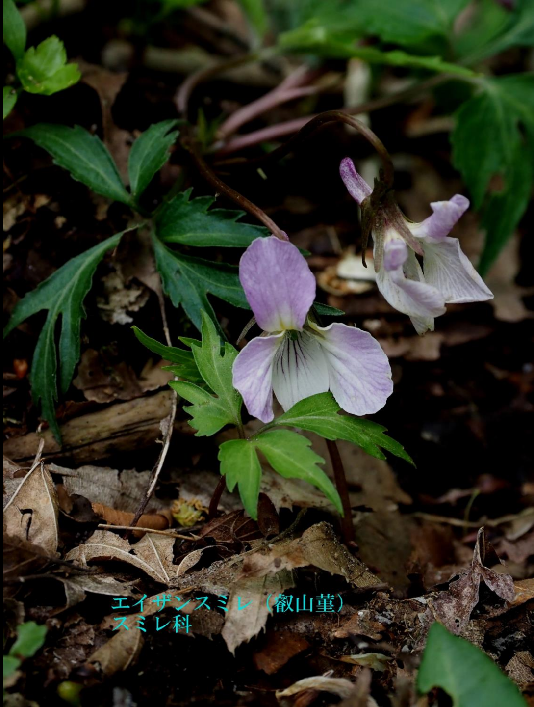
アイザンスミレ (叡山堇) スミレ科