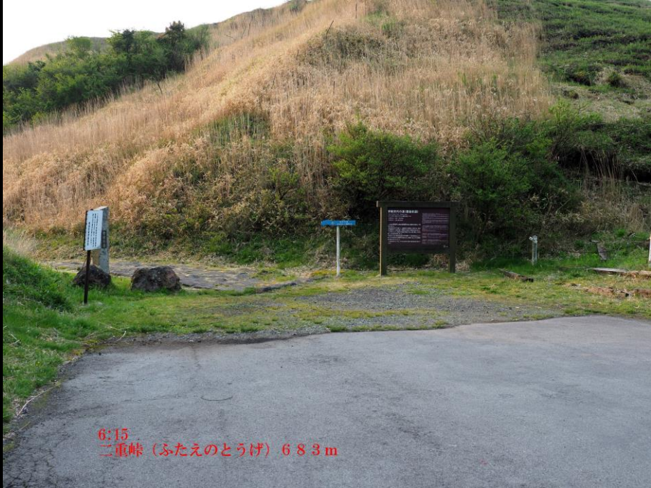
6:15 二重峠 (ふたえのとうげ) 683m