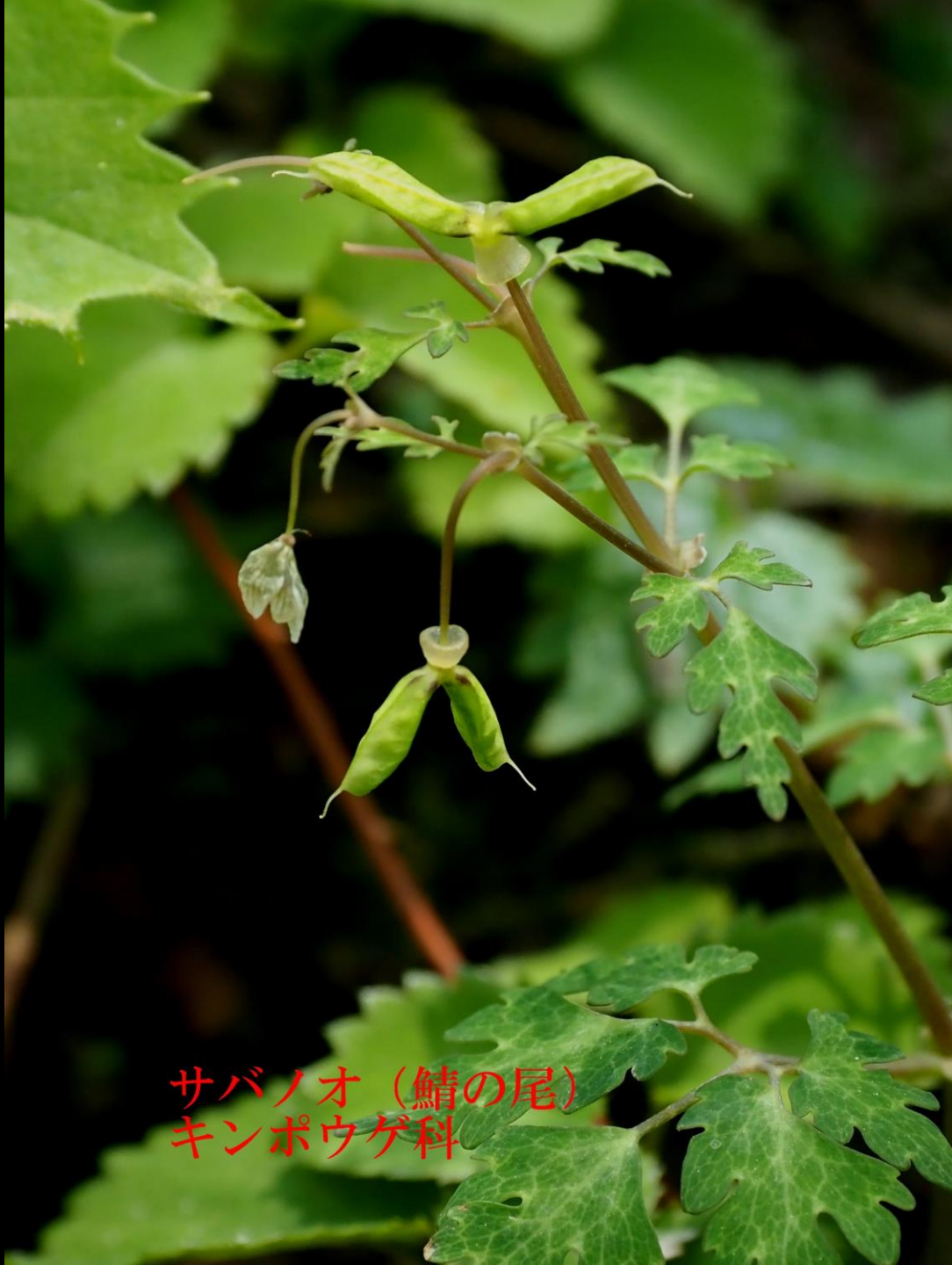
サバノオ (鯖の尾) キンポウゲ科