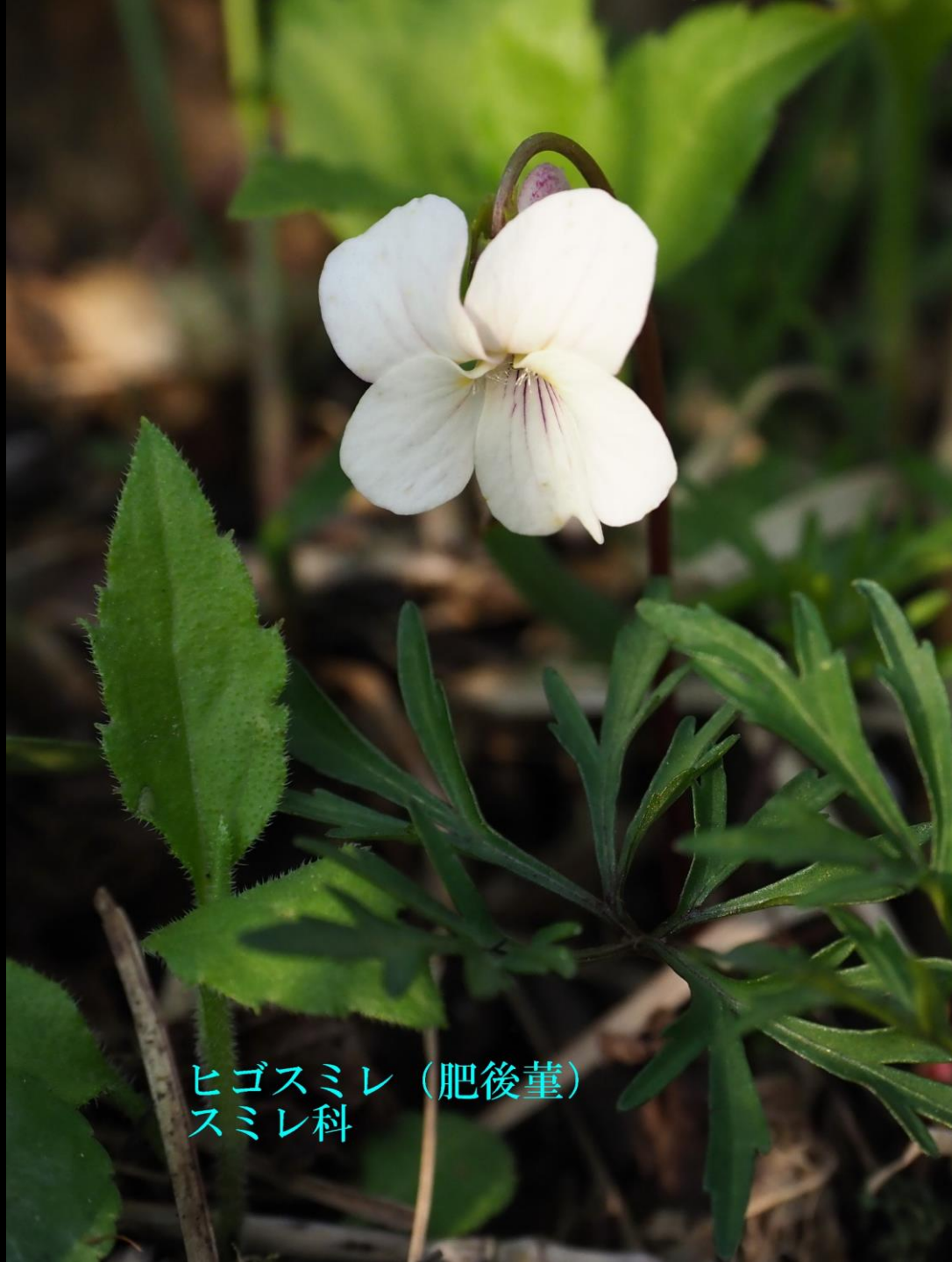
ヒゴスミレ (肥後堇) スミレ科