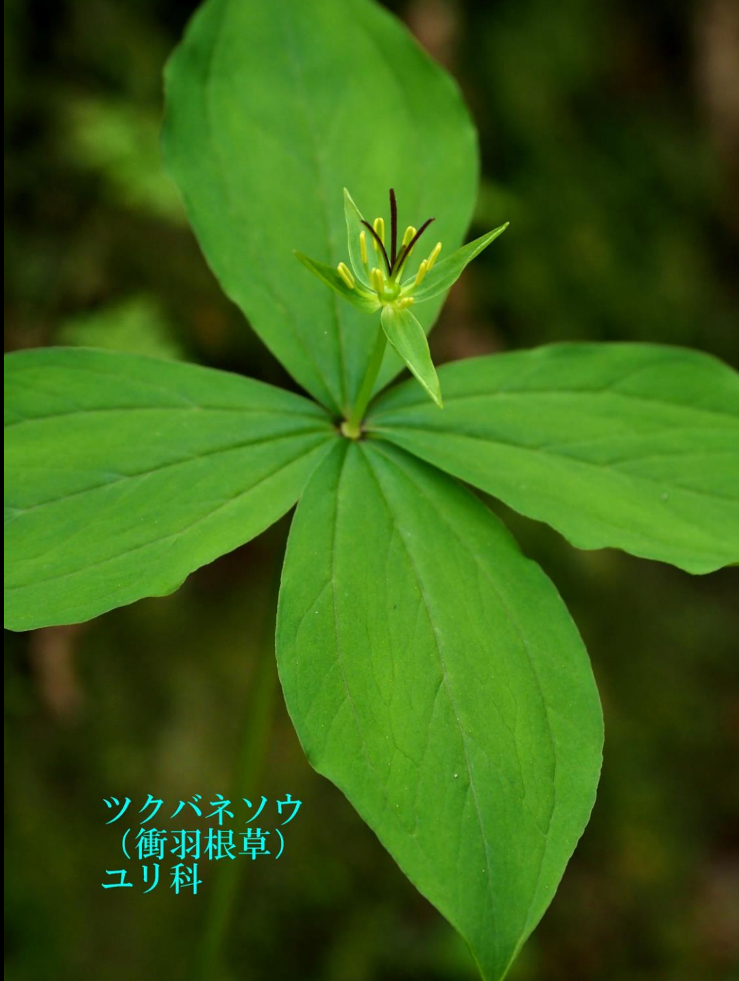
ツクバネソウ (衝羽根草) ユリ科