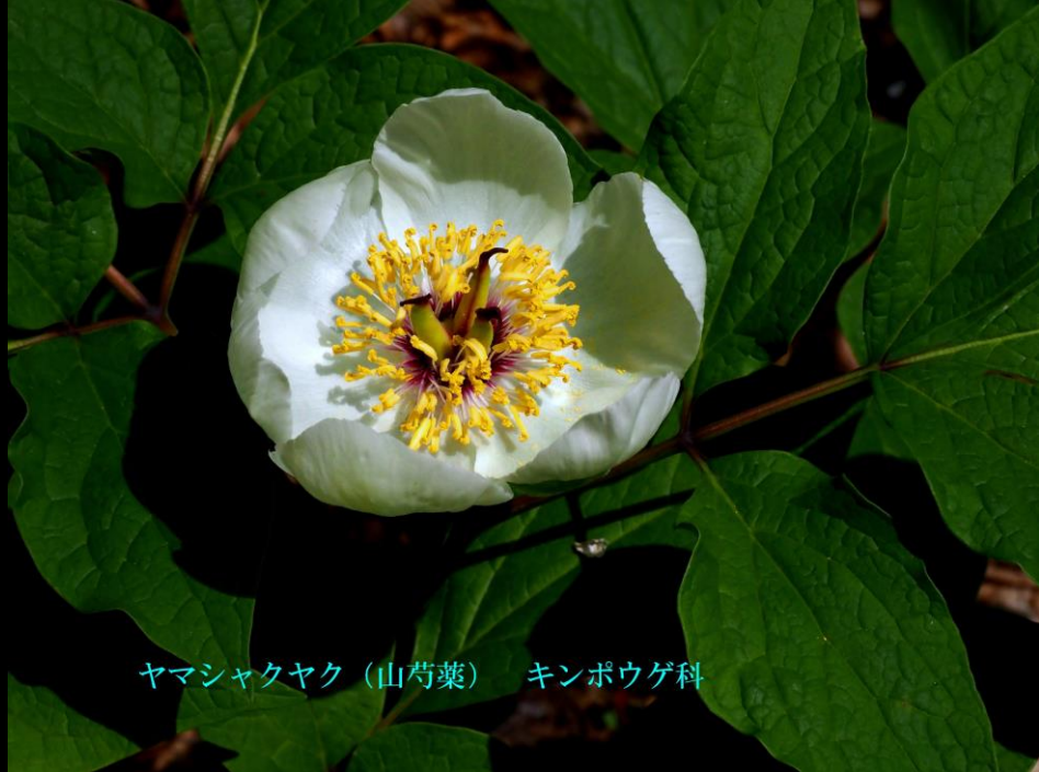
ヤマシャクヤク (山芍薬) キンポウゲ科